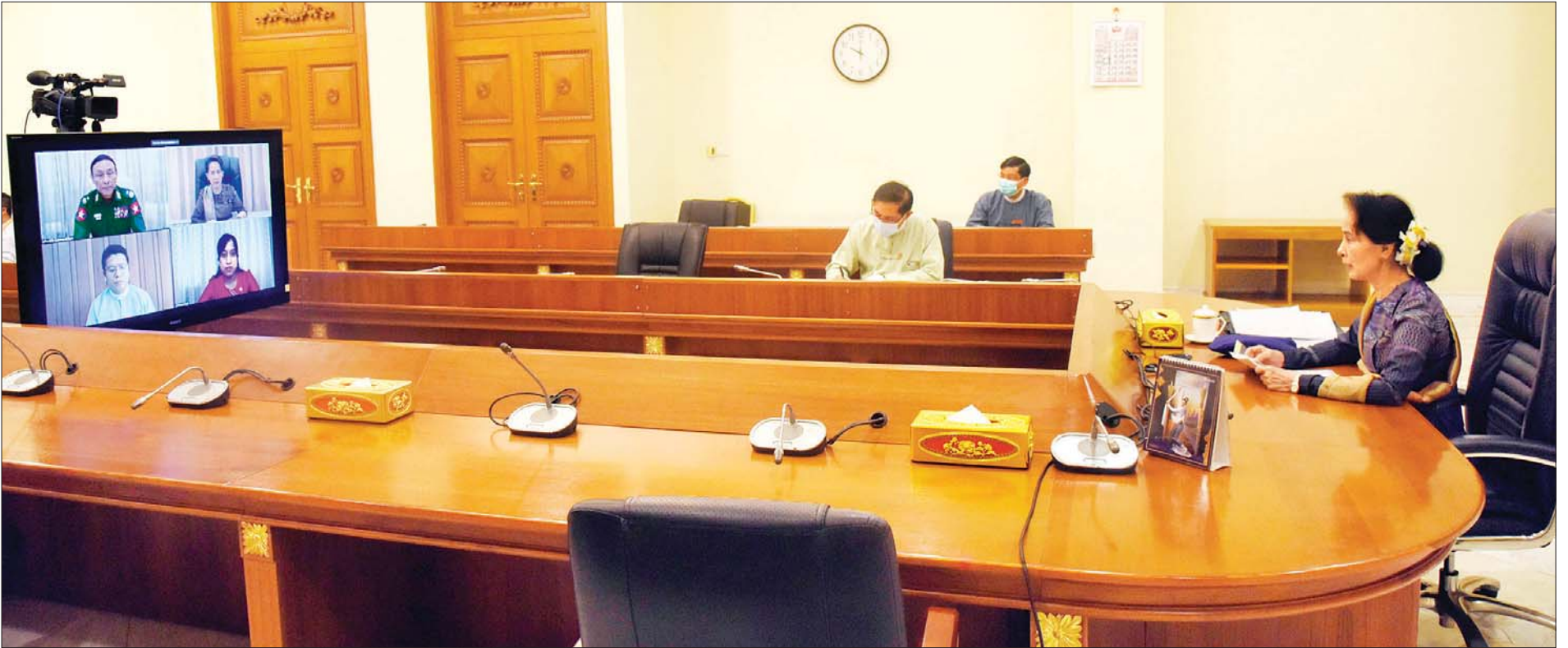
နိုင်ငံတော်၏အတိုင်ပင်ခံပုဂ္ဂိုလ် ဒေါ်အောင်ဆန်းစုကြည် COVID-19 ဓာတ်ခွဲအတည်ပြုလူနာနှင့် ထိတွေ့ခဲ့သူများအား စုံစမ်းရှာဖွေဖော်ထုတ်ခြင်း၊ ကာကွယ်၊ ထိန်းချုပ်ရေး စီမံဆောင်ရွက်ခြင်းတို့နှင့်စပ်လျဉ်း၍ ပြည်ထဲရေးဝန်ကြီးဌာန ဒုတိယဝန်ကြီး ဗိုလ်ချုပ်စိုးတင်နိုင်၊ ရန်ကုန်တောင်ပိုင်းခရိုင် အထွေထွေအုပ်ချုပ်ရေးဦးစီးဌာန ခရိုင်အုပ်ချုပ်ရေးမှူး ဦးနေဝင်းအောင်၊ ရန်ကုန်တိုင်းဒေသကြီး ပြည်သူ့ကျန်းမာရေးဦးစီးဌာန လက်ထောက်ညွှန်ကြားရေးမှူး ဒေါက်တာသက်စုမန်တို့နှင့် Video Conferencing စနစ်ဖြင့် ချိတ်ဆက်တွေ့ဆုံပြီး လက်တွေ့အခြေအနေများ အပြန်အလှန်ဆွေးနွေးစဉ်။ သတင်းစဉ်