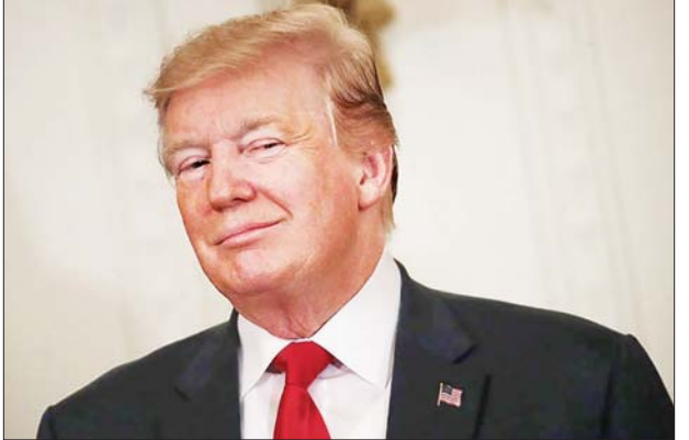
အမေရိကန်သမ္မတဒေါ်နယ်ထရမ်။