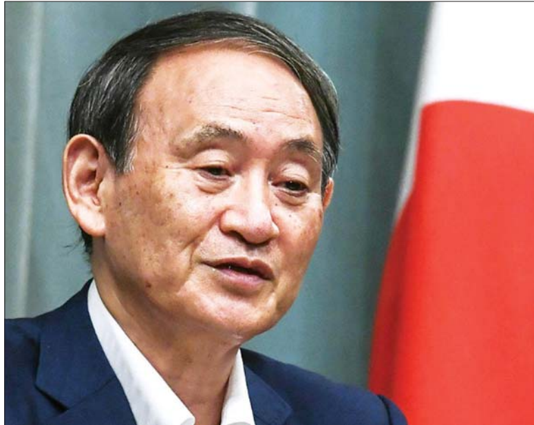
ဂျပန်ဝန်ကြီးချုပ်နေရာအတွက် ပြိုင်ပွဲဝင်သူအဖြစ် ကြေညာခဲ့သည့် ဂျပန်အစိုးရအဖွဲ့ အတွင်းရေး မှူးချုပ် ဆူဂါယိုရှိဟိဒို။