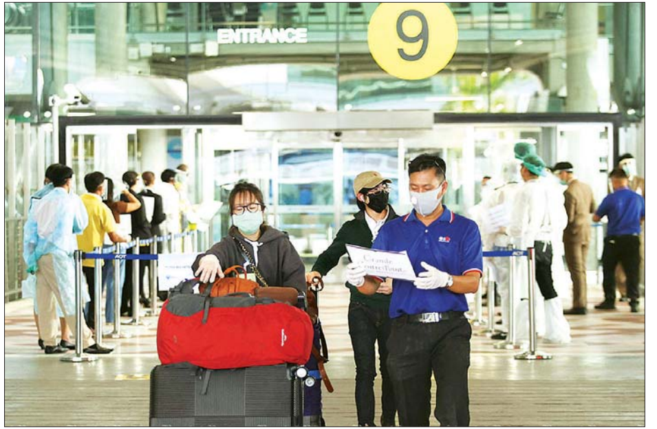
သုဝဏ္ဏဘူမိလေဆိပ်တွင် ဩစတြေးလျနိုင်ငံမှပြန်လာသော ခရီးသည်များကိုတွေ့ရစဉ်။

အစိုးရအနေဖြင့် ခရီးသွားလုပ်ငန်း နာလန်ထူလာပြီး တိုင်းပြည်၏ စီးပွားရေးအရှိန်အဟုန်ဖွံ့ဖြိုးတိုးတက်လာ စေရေး နိုင်ငံခြားခရီးသွားများကို ဝင်ရောက်ခွင့်ပေးနိုင်မည့် သင့်လျော်သည့် ကန့်သတ်လုပ်ငန်းများကို စဉ်းစားပေး သင့်သည်ဟု ၎င်းက ပြောသည်။ အကယ်၍ နိုင်ငံခြား ခရီးသွားများ ထိုင်းနိုင်ငံသို့ လာရောက်လည်ပတ်ခွင့်ကို ဆက်လက်ပိတ်ထားပါက လာမည့်နှစ်တွင် ထိုင်းနိုင်ငံ၏ စီးပွားရေးဖွံ့ဖြိုးမှုတွင် ထိခိုက်မှုများ ရှိလာနိုင်ကြောင်း ၎င်းက သတိပေးပြောကြားခဲ့သည်။ ဘန်ကောက်ပို့စ်