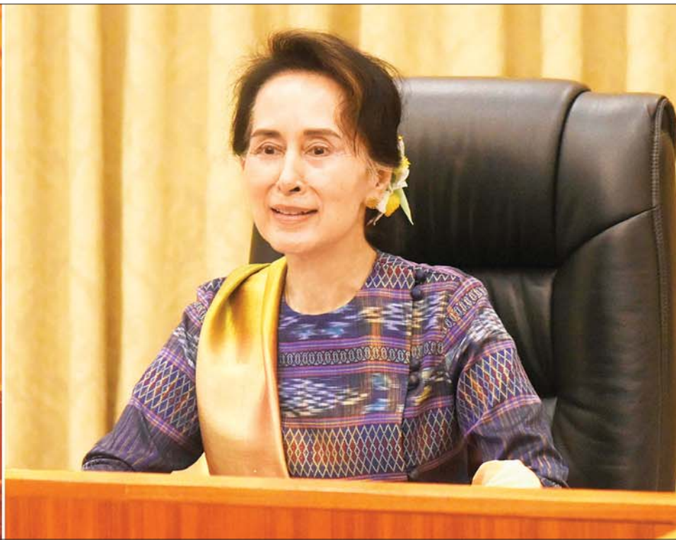
နိုင်ငံတော်၏အတိုင်ပင်ခံပုဂ္ဂိုလ် ဒေါ်အောင်ဆန်းစုကြည် COVID-19 ဓာတ်ခွဲအတည်ပြုလူနာနှင့် ထိတွေ့ခဲ့သူများအား စုံစမ်းရှာဖွေဖော်ထုတ်ခြင်း၊ ကာကွယ်၊ ထိန်းချုပ်ရေး စီမံဆောင်ရွက်ခြင်းတို့နှင့်စပ်လျဉ်း၍ ပြည်ထဲရေးဝန်ကြီးဌာန ဒုတိယဝန်ကြီး ဗိုလ်ချုပ်စိုးတင်နိုင်၊ ရန်ကုန်တောင်ပိုင်းခရိုင် အထွေထွေအုပ်ချုပ်ရေးဦးစီးဌာန ခရိုင်အုပ်ချုပ်ရေးမှူး ဦးနေဝင်းအောင်၊ ရန်ကုန်တိုင်းဒေသကြီး ပြည်သူ့ကျန်းမာရေးဦးစီးဌာန လက်ထောက်ညွှန်ကြားရေးမှူး ဒေါက်တာသက်စုမွန်တို့နှင့် Video Conferencing စနစ်ဖြင့် ချိတ်ဆက်တွေ့ဆုံပြီး လက်တွေ့အခြေအနေများ အပြန်အလှန် ဆွေးနွေးစဉ်။ သတင်းစဉ်

နေပြည်တော် စက်တင်ဘာ ၂ Coronavirus Disease 2019(COVID-19)ကာကွယ်၊ ထိန်းချုပ်၊ ကုသရေး အမျိုးသားအဆင့်ဗဟိုကော်မတီဥက္ကဋ္ဌ နိုင်ငံတော်၏အတိုင်ပင်ခံပုဂ္ဂိုလ် ဒေါ်အောင်ဆန်းစုကြည်သည် COVID-19 ဓာတ်ခွဲအတည်ပြုလူနာနှင့် ထိတွေ့ခဲ့သူများ အား စုံစမ်းရှာဖွေဖော်ထုတ်ခြင်း၊ ကာကွယ်၊ ထိန်းချုပ်ရေး စီမံဆောင်ရွက်ခြင်းတို့နှင့်စပ်လျဉ်း၍ ပြည်ထဲရေးဝန်ကြီးဌာန ဒုတိယဝန်ကြီး ဗိုလ်ချုပ်စိုးတင်နိုင်၊ ရန်ကုန်တောင်ပိုင်းခရိုင် အထွေထွေအုပ်ချုပ်ရေးဦးစီးဌာန ခရိုင်အုပ်ချုပ်ရေးမှူး ဦးနေဝင်းအောင်၊ ရန်ကုန်တိုင်းဒေသကြီး ပြည်သူ့ကျန်းမာရေးဦးစီးဌာန လက်ထောက်ညွှန်ကြားရေးမှူး ဒေါက်တာ သက်စုမွန်တို့နှင့် ယနေ့နံနက် ၁၀ နာရီတွင် နေပြည်တော်ရှိ နိုင်ငံတော်သမ္မတအိမ်တော် အစည်းအဝေးခန်းမ၌ Video Conferencing စနစ်ဖြင့် ချိတ်ဆက်တွေ့ဆုံပြီး လက်တွေ့အခြေအနေများကို အပြန်အလှန် ဆွေးနွေးသည်။ စာမျက်နှာ ၃ ကော်လံ ၁