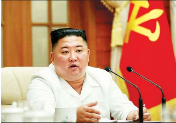
ဩဂုတ် ၁၉ ရက်က ပြုလုပ်ခဲ့သည့် ပါတီအစည်းအဝေးတစ်ခုတွင် မိန့်ခွန်း ပြောနေသော မြောက်ကိုရီးယားခေါင်းဆောင် ကင်ဂျီအန်းကို တွေ့ရစဉ်။

အမေရိကန်အစိုးရက မြောက်ကိုရီးယားနိုင်ငံသည် ၎င်း၏ နျူကလီးယား ရည်မှန်းချက်များကို ပြန်လည်လုပ်ဆောင်နေကြောင်း စွပ်စွဲပြောကြားလိုက် သည်။ ထို့အပြင် မြောက်ကိုရီးယားနိုင်ငံအနေဖြင့် ၎င်း၏ နျူကလီးယား