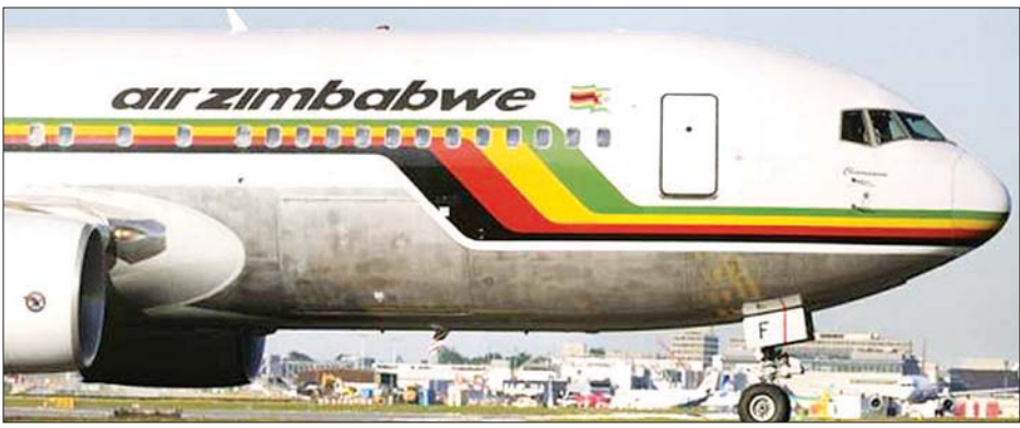
အဲယား ဇင်ဘာဘွေလေကြောင်းလိုင်းမှ လေယာဉ်တစ်စင်းကို တွေ့ရစဉ်။

စတင်နိုင်ရန် ပြည်တွင်းလေကြောင်း လိုင်းများ ပြန်လည်ပြေးဆွဲနိုင်ရေးကို အစိုးရက အပြီးသတ် ဆောင်ရွက်မှု များ ပြုလုပ်နေသည်ဟု ၎င်းက ဆက်လက်ပြောကြားခဲ့သည်။ မတ်လ နှောင်းပိုင်းမှစတင်ကာ ကိုဗစ်-၁၉