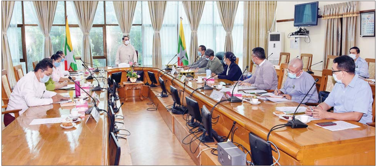
ပြည်ထောင်စုဝန်ကြီး ဒေါက်တာသန်းမြင့် ထားဝယ်အထူးစီးပွားရေးဇုန်နှင့် မြန်မာ-ထိုင်းနယ်စပ် (ထီးခီး) သို့ ဆက်သွယ်ဖောက်လုပ်မည့် နှစ်လမ်းသွားကားလမ်းစီမံကိန်းနှင့်စပ်လျဉ်းသည့် လုပ်ငန်းညှိနှိုင်းအစည်းအဝေးတွင် အမှာစကားပြောကြားစဉ်

လမ်း စီမံကိန်းဖောက်လုပ်ရေးနှင့် ပတ်သက်ပြီး ထိုင်းနိုင်ငံ NEDA နှင့် ညှိနှိုင်းဆွေးနွေးခြင်း တိုးတက်မှုအခြေအနေများ၊ ပြည်ထောင်စုလွှတ်တော်မှ အတည်ပြုထားပြီးဖြစ်သည့် ချေးငွေကို ထိုင်းနိုင်ငံမှရရှိရေးအတွက် NEDA နှင့် ညှိနှိုင်းဆောင်ရွက်မှုနှင့် တိုးတက်မှုအခြေအနေများ၊ နှစ်လမ်းသွား ကားလမ်းဖောက်လုပ်ရန်အတွက် သဘာဝပတ်ဝန်းကျင်ဆိုင်ရာ ဆန်းစစ်လေ့လာမှုဆိုင်ရာ ဆောင်ရွက်ပြီးစီးမှု အခြေအနေများနှင့် ဆက်လက်ဆောင်ရွက်မည့် လုပ်