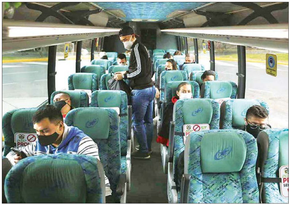
ကိုလံဘီယာမြို့တော် ဘိုဂိုတာသို့ သွားရောက်မည့် ခရီးသွားများကို ဘတ်စ်ကားပေါ်တွင် တွေ့ရစဉ်။

အသက် ၂၉နှစ်အရွယ်ဒစ်ဂျစ်ဂျာနယ်လစ်ကို လော့စ်အိန်ဂျလစ်မြို့ ရဲဌာနမှ ရဲအရာရှိနှစ်ဦးက ဩဂုတ် ၃၁ ရက်တွင် ပစ်သတ်ခဲ့သည်ဟု အမေရိကန် မီဒီယာများတွင် ဖော်ပြကြသည်။ အကြိမ်အရေအတွက် ၂၀ ကျော် ပစ်ခတ် ခဲ့သည်ဟု မိသားစုရှေ့နေက ပြောသည်။ ကာဗီနီမှာ လက်ထပ် သေဆုံးမှုကို ပစ်ချပြီး ရဲအရာရှိတစ်ဦးကို ထိုးနှက်ခဲ့သည့်အတွက် ပစ်ခတ်လိုက်ခြင်း ဖြစ်ကြောင်း ရဲများကပြောသည်။ ယင်းဖြစ်ရပ်ကြောင့် ဆန့်ကျင်ဆန္ဒပြမှု များ ပေါ်ပေါက်လာသည်။ ယင်းအဖြစ်အပျက်ကို ရိုက်ကူးထားသည့် ဗီဒီယိုပုံစံကို လူမှုကွန်ရက်တွင် မျှဝေကြရန်လည်း လူ့အခွင့်အရေးရှေ့နေက တောင်းဆိုထားသည်။ အင်န်အိတ်ချီက