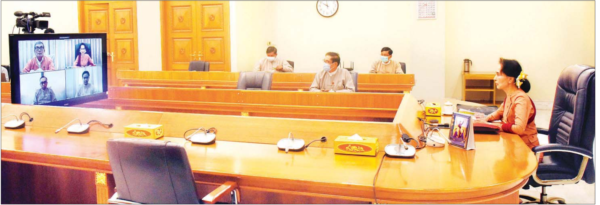
နိုင်ငံတော်၏အတိုင်ပင်ခံပုဂ္ဂိုလ် ဒေါ်အောင်ဆန်းစုကြည် ရခိုင်ပြည်နယ်အတွင်း COVID-19 ကာကွယ်၊ ထိန်းချုပ်၊ ကုသရေးနှင့်စပ်လျဉ်း၍ ရခိုင်ပြည်နယ်အစိုးရအဖွဲ့ဝန်ကြီးချုပ် ဦးညီပု၊ ရခိုင်ပြည်နယ် ကုသရေးနှင့် ပြည်သူ့ကျန်းမာရေး ဦးစီးဌာနမှူး ဒေါက်တာစိုင်းဝင်းဇော်လှိုင်နှင့် ရန်ကုန်တိုင်းဒေသကြီး အင်းစိန်မြို့နယ်မှ စစ်တွေမြို့သို့ ရောက်ရှိနေသည့် Volunteer စောသော်မိုးအယ်တို့နှင့် Video Conferencing စနစ်ဖြင့် ချိတ်ဆက်တွေ့ဆုံပြီး လက်တွေ့အခြေအနေများကို အပြန်အလှန် ဆွေးနွေးစဉ်။ သတင်းစဉ်