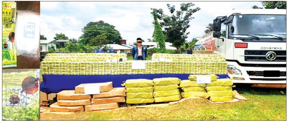
ဖမ်းဆီးရမိသည့် အိုက်စ်(မက်အဖက်တမင်း)များနှင့် ယာဉ်အားတွေ့ရစဉ်။