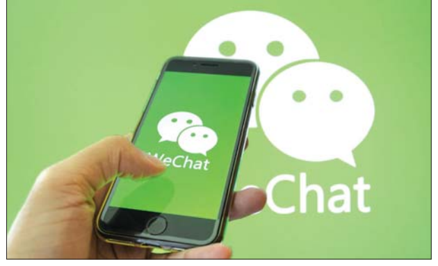
ဖုန်းတစ်ခုအတွင်း အင်စတာလုပ်ထားသော ဝီချက်အက်ပဲလ်ကိုတွေ့ရစဉ်။