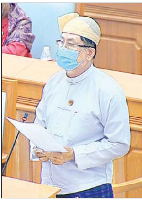
ဒုတိယဝန်ကြီး ဦးမောင်မောင်ဝင်း

ဆက်လက်၍ ဆောက်လုပ်ရေးဝန်ကြီးဌာန ဒုတိယဝန်ကြီး ဒေါက်တာ ကျော်လင်းက ယင်းကိစ္စနှင့်စပ်လျဉ်း၍ ပြန်လည်ရှင်းလင်းဆွေးနွေးရာတွင် သံလွင်မြစ်ကူးတံတား (တာဆန်း) ကြိုးတံတားသစ် တည်ဆောက်ပြီးစီးပါက ယာဉ်တစ်စီးချင်းခံနိုင်စွမ်း ၇၅ တန် ရှိမည်ဖြစ်ပြီး တောင်ကြီးမြို့မှ ထိုင်းနိုင်ငံသို့ လူစီးယာဉ်ငယ်များသာမက ကုန်တင်ယာဉ်၊ တွဲကားများပါ အဆင်ပြေချောမွေ့စွာ ကုန်သွယ်သွားလာနိုင်မည်ဖြစ်သည့်အတွက် ရှမ်းပြည်နယ်၏ ကုန်သွယ်ရေးနှင့် သယ်ယူပို့ဆောင်ရေးလုပ်ငန်းများ ဖွံ့ဖြိုးတိုးတက်လာမည် ဖြစ်ပါကြောင်း၊ ရှမ်းပြည်နယ်၏ ဒေသဖွံ့ဖြိုးတိုးတက်ရေးသည် တာဆန်းတံတားအပေါ်တွင်