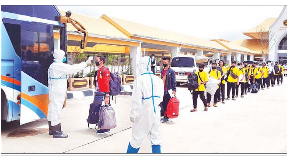
ထိုင်းနိုင်ငံမှ ပြန်လည်ရောက်ရှိသူများကို ကျန်းမာရေးစစ်ဆေးပေးစဉ်။

နေပြည်တော် ဩဂုတ် ၂၈ - ထိုင်းနိုင်ငံ၏ လူကုန်ကူးမှုတိုက်ဖျက်ရေးဥပဒေအရ ထိုင်းနိုင်ငံမှ လူကုန်ကူးခံရသူများအဖြစ် စိစစ်ဖော်ထုတ်သတ်မှတ်ခဲ့သည့် လူကုန်ကူးခံရသူ ၃၂ ဦးနှင့် ကလေးသူငယ်အခွင့်အရေးများဆိုင်ရာ ကွန်ဗင်းရှင်းပါ ပြဋ္ဌာန်းချက်များအရ ကာကွယ်စောင့်ရှောက်ရန် လိုအပ်သူ အမျိုးသားကလေးလေးဦး စုစုပေါင်း မြန်မာနိုင်ငံသား ၃၆ ဦးအား ယနေ့တွင် မြဝတီ-မဲဆောက် ချစ်ကြည်ရေးတံတားအမှတ်(၂)မှတစ်ဆင့် ပြန်လည်လွှဲပြောင်းလက်ခံခဲ့သည်။