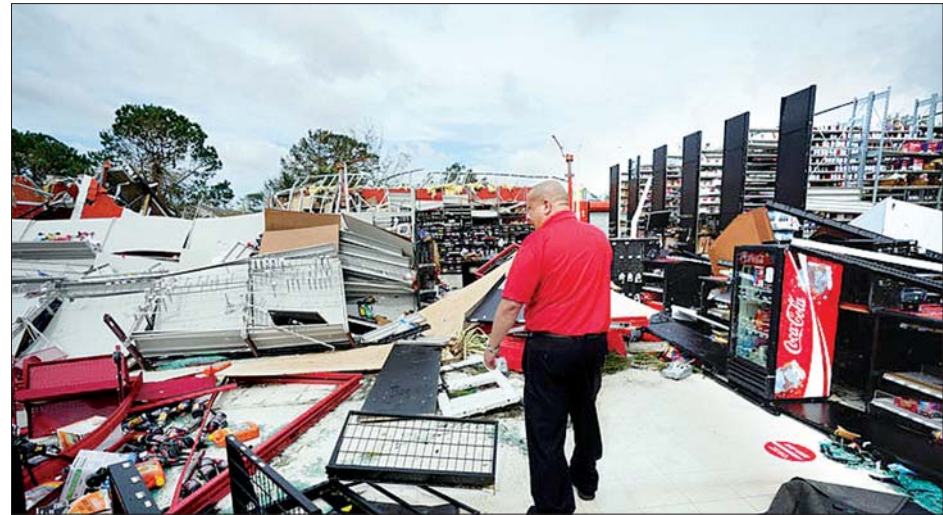
မုန်တိုင်းကြောင့်ပျက်စီးနေသည့် အပျက်အစီးများကို တွေ့ရစဉ်။