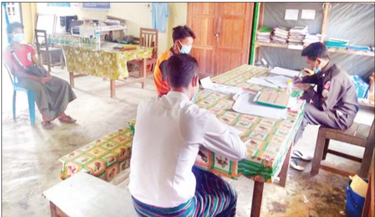
မွေးကြူဇင်

နန်းယွန်း၊ ဩဂုတ် ၂၈ စစ်ကိုင်းတိုင်းဒေသကြီး နာဂကိုယ်ပိုင်အုပ်ချုပ်ခွင့်ရဒေသ နန်းယွန်း၊ ဒုံဟီးနှင့် ပန်ဆောင်မြို့နယ်များ၌ ၂၀၂၀ ပြည့်နှစ် နိုဝင်ဘာ ၈ ရက်တွင် ကျင်းပမည့် ပါတီစုံဒီမိုကရေစီအထွေထွေရွေးကောက်ပွဲတွင် အသက် ၁၈ နှစ်ပြည့်ပြီး သူတိုင်း ဆန္ဒမဲပေးပိုင်ခွင့် မဆုံးရှုံးစေရေးအတွက် နိုင်ငံသားစိစစ်ရေးကတ် မရရှိသေးသောသူများကို အဖွဲ့သုံးဖွဲ့ခွဲပြီး ဆောင်ရွက်ပေးလျက်ရှိကြောင်း သိရသည်။ နန်းယွန်းမြို့နယ်တွင် ရပ်ကွက် သုံးခုနှင့် ကျေးရွာအုပ်စု ၁၆ အုပ်စု၊ ဒုံဟီးမြို့နယ်တွင် ရပ်ကွက် သုံးခု၊ ကျေးရွာအုပ်စု ၃၂ အုပ်စု၊ ပန်ဆောင်မြို့နယ်တွင် ရပ်ကွက် သုံးခု၊ ကျေးရွာအုပ်စု ကိုးအုပ်စု စုစုပေါင်း ရပ်ကွက် ကိုးခု၊ ကျေးရွာအုပ်စု ၅၇ အုပ်စုတွင် နိုင်ငံသားစိစစ်ရေးကတ် မရရှိသေးသူ ၃၀၀၀ ကျော်ကို အဖွဲ့သုံးဖွဲ့ခွဲပြီး ကွင်းဆင်းဆောင်ရွက်ပေးပြီးဖြစ်ကြောင်းနှင့် ကျန်ရှိနေသော ရပ်ကွက်၊ ကျေးရွာများကိုလည်း ဆက်လက်ကွင်းဆင်းဆောင်ရွက်ပေးသွားမည်ဖြစ်ကြောင်း အလုပ်သမား၊ လူဝင်မှုကြီးကြပ်ရေးနှင့် ပြည်သူ့အင်အားဆိုင်ရာ နန်းယွန်းမြို့နယ် ဦးစီးမှူးရုံးမှ သိရသည်။