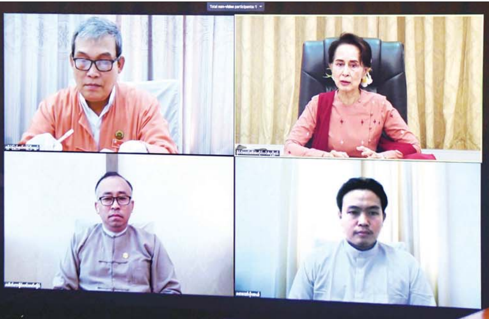
နိုင်ငံတော်၏အတိုင်ပင်ခံပုဂ္ဂိုလ် ဒေါ်အောင်ဆန်းစုကြည် ရခိုင်ပြည်နယ်အတွင်း COVID-19 ကာကွယ်၊ ထိန်းချုပ်၊ ကုသရေးနှင့်စပ်လျဉ်း၍ ရခိုင်ပြည်နယ်အစိုးရအဖွဲ့ဝန်ကြီးချုပ် ဦးညီပု၊ ရခိုင်ပြည်နယ် ကုသရေးနှင့် ပြည်သူ့ကျန်းမာရေး ဦးစီးဌာနမှူး ဒေါက်တာစိုင်းဝင်းဇော်လှိုင်နှင့် ရန်ကုန်တိုင်းဒေသကြီး အင်းစိန်မြို့နယ်မှ စစ်တွေမြို့သို့ ရောက်ရှိနေသည့် Volunteer စောသော်မိုးအယ်တို့နှင့် Video Conferencing စနစ်ဖြင့် ချိတ်ဆက်တွေ့ဆုံပြီး လက်တွေ့အခြေအနေများကို အပြန်အလှန် ဆွေးနွေးစဉ်။ သတင်းစဉ်

နေပြည်တော် ဩဂုတ် ၂၈ Coronavirus Disease 2019(COVID-19)ကာကွယ်၊ ထိန်းချုပ်၊ ကုသရေး အမျိုးသားအဆင့်ဗဟိုကော်မတီဥက္ကဋ္ဌ နိုင်ငံတော်၏အတိုင်ပင်ခံပုဂ္ဂိုလ် ဒေါ်အောင်ဆန်းစုကြည်သည် ရခိုင်ပြည်နယ်အတွင်း COVID-19 ကာကွယ်၊ ထိန်းချုပ်၊ ကုသရေးနှင့်စပ်လျဉ်း၍ ရခိုင်ပြည်နယ်အစိုးရအဖွဲ့ဝန်ကြီးချုပ် ဦးညီပု၊ ရခိုင်ပြည်နယ် ကုသရေးနှင့် ပြည်သူ့ကျန်းမာရေး ဦးစီးဌာနမှူး ဒေါက်တာစိုင်းဝင်းဇော်လှိုင်နှင့် ရန်ကုန်တိုင်းဒေသကြီး အင်းစိန်မြို့နယ်မှ စစ်တွေမြို့သို့ ရောက်ရှိ နေသည့် Volunteer စောသော်မိုးအယ်တို့နှင့် ယနေ့နံနက် ၁၀ နာရီတွင် နေပြည်တော်ရှိ နိုင်ငံတော်သမ္မတအိမ်တော် အစည်းအဝေးခန်းမ၌ Video Conferencing စနစ်ဖြင့် ချိတ်ဆက်တွေ့ဆုံပြီး လက်တွေ့အခြေအနေများကို အပြန်အလှန် ဆွေးနွေးသည်။ စာမျက်နှာ ၃ ကော်လံ ၁ □