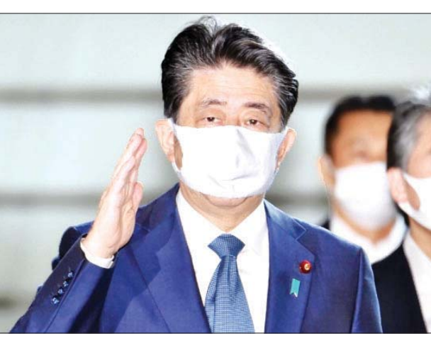
ဂျပန်ဝန်ကြီးချုပ် ရှင်ဇီအာဘေး

အာဘေးသည် ယခုလတွင် သုံးရက်ကြာ အားလပ်ရက်ထွက်ခဲ့ပြီး ဩဂုတ် ၁၇ ရက်တွင် ဆေးရုံသို့ သွားမည်ဖြစ်ကြောင်း ကြေညာခဲ့ သည်။ အဆိုပါ ဆေးရုံတွင် ခုနစ်နာရီ