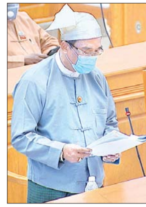
ဒုတိယဝန်ကြီး ဒေါက်တာကျော်လင်း