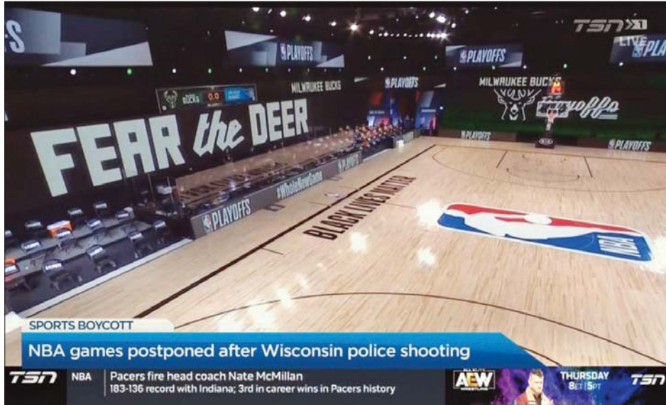
အမျိုးသားဘတ်စကက်ဘောပြိုင်ပွဲ ဖျက်သိမ်းထားသည်ကို တွေ့မြင်ရစဉ်။

ဆွေးနွေးတိုင်ပင်မှုများ ပြုလုပ်လျက် ရှိသည်။ အင်န်အိတ်ချ်ကေ