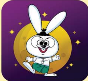
Waso Learn G10-12

အတန်းတစ်တန်း စာသင်နှစ်နှစ်လုံးစာ မူလတန်း - ၅၀၀၀ ကျပ် (ဘာသာစုံ) အလယ်တန်း - ၅၀၀၀ ကျပ် (ဘာသာစုံ) အထက်တန်း - ၉၀၀၀ ကျပ် (ဘာသာစုံ) သင်ရိုးကုန် သင်ခန်းစာတိုင်းကို သင်ကြားပေးထားသည်။