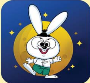
Waso Learn G1-9

ဝါဆိုလန်းကတော့ Strategy First Education Group ရဲ့ လူမှုအကျိုးရှေးရှုတဲ့ လုပ်ငန်းတစ်ခု ဖြစ်ပါတယ်။ ဝါဆိုလန်းကို ဆရာ၊ ဆရာမ မလုံလောက်တဲ့ ဒေသများအပါအဝင် မြန်မာနိုင်ငံအဝှမ်း ကျောင်းသား၊ ကျောင်းသူများ သင်ခန်းစာတွေကို တစ်ပြေးညီ ထိရောက်စွာ သင်ယူခွင့် ရရှိရေးအတွက် သက်သာတဲ့ နှုန်းထားများနဲ့ စီစဉ်ပေးထားပါတယ်။ Waso Learn Mobile Applications ကို တစ်နိုင်လုံးမှာရှိတဲ့ အစိုးရ စာသင်ကျောင်းတွေက ဆရာ၊ ဆရာမများ နဲ့ ဘုန်းတော်ကြီးသင် ပညာရေးကျောင်းများ၊ ပရဟိတ ကျောင်းများမှာ သင်ကြားပြသပေးနေသော ဆရာ၊ ဆရာမများအတွက် အခမဲ့ အသုံးပြု နိုင်အောင် စီစဉ်လှူဒါန်း ပေးနေပါတယ်။