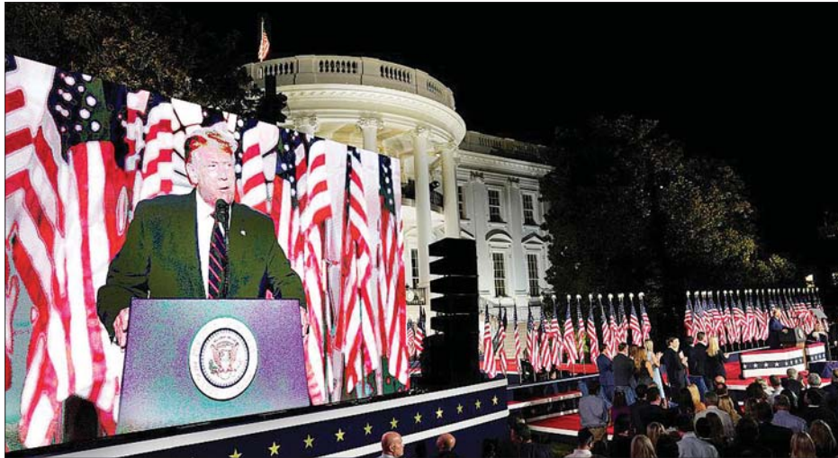
အမေရိကန်သမ္မတ ဒေါ်နယ်ထရမ် မိန့်ခွန်းပြောကြားနေစဉ်။