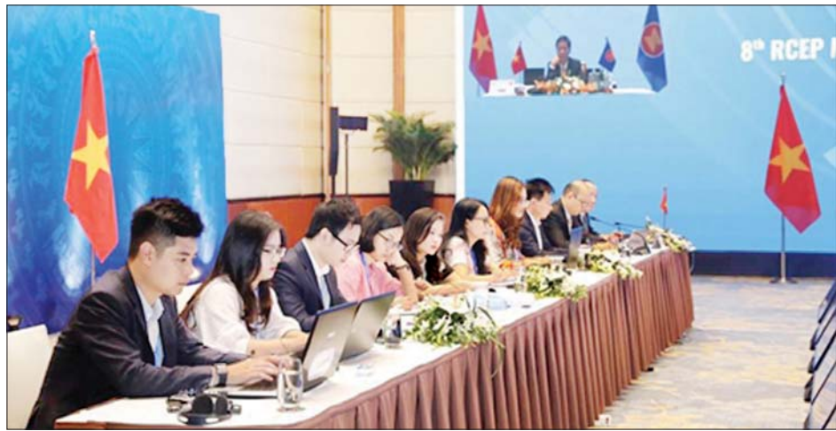
တရုတ် - အာဆီယံ အစည်းအဝေးကျင်းပနေသည့်ကို တွေ့ရစဉ်။

ဟန့်ရှင်း ဩဂုတ် ၂၈ တရုတ်နိုင်ငံနှင့် အရှေ့တောင်အာရှနိုင်ငံများအသင်း (အာဆီယံ) အဖွဲ့ဝင်နိုင်ငံများဆိုင်ရာ စီးပွားရေးဝန်ကြီးများက ကိုဗစ်-၁၉ ရောဂါသက်ရောက်မှုများ ရှိနေသည့်ကြားက နှစ်ဖက်ကုန်သွယ်ရေးနှင့် ရင်းနှီးမြှုပ်နှံမှုအခိုင်အမာတိုးတက်လာသည်ကို ကြိုဆိုကြောင်း ဩဂုတ် ၂၇ ရက်က ပြောကြားလိုက်သည်။