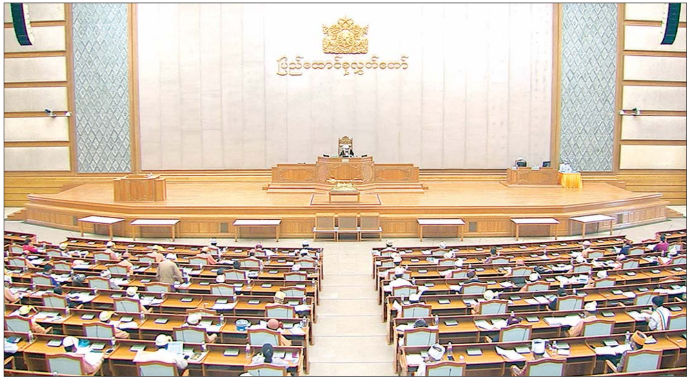
ဒုတိယအကြိမ် ပြည်ထောင်စုလွှတ်တော် (၁၇)ကြိမ်မြောက် ပုံမှန်အစည်းအဝေး ကျင်းပစဉ်။ သတင်းစဉ်