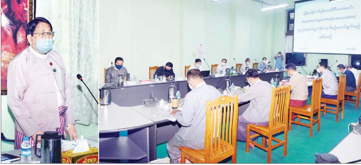
ပြည်ထောင်စုဝန်ကြီး ဒေါက်တာဖေမြင့် မြန်မာနိုင်ငံ ဒစ်ဂျစ်တယ်မီဒီယာအသင်းဖြစ်မြောက်ရေး ကော်မတီဖွဲ့စည်းနိုင်ရေး အစည်းအဝေးတွင် အမှာစကား ပြောကြားစဉ်။

ရန်ကုန် ဩဂုတ် ၂၈ ပြန်ကြားရေး ဝန်ကြီးဌာန ပြည်ထောင်စုဝန်ကြီး ဒေါက်တာ ဖေမြင့်သည် ယနေ့ မွန်းလွဲပိုင်းတွင် ရန်ကုန်မြို့ သိမ်ဖြူလမ်း အမှတ်(၂၅) ရှိပုံနှိပ်ရေးနှင့်ထုတ်ဝေရေးဦးစီးဌာန၏ ဗဟိုပုံနှိပ်စက်ရုံ အစည်းအဝေးခန်း၌ ကျင်းပသည့် မြန်မာနိုင်ငံ ဒစ်ဂျစ်တယ် မီဒီယာအသင်း ဖြစ်မြောက်ရေး ကော်မတီဖွဲ့စည်းနိုင်ရေး အစည်းအဝေးသို့ တက်ရောက်သည်။