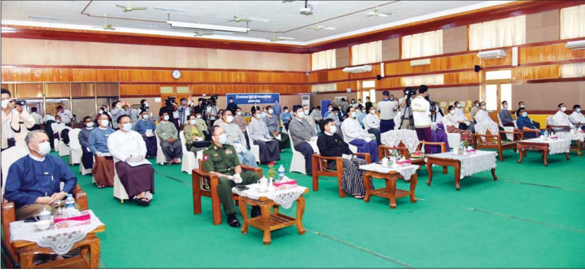
ပြည်ထောင်စုဝန်ကြီး ဒေါက်တာမေမြင့် နိုင်ငံတော်အစိုးရ၏ ပြုပြင်ပြောင်းလဲရေးဆောင်ရွက်ချက် မှတ်တမ်းစာအုပ်များ မိတ်ဆက်ဖြန့်ချိပွဲ အခမ်းအနားတွင် အမှာစကားပြောကြားစဉ်။ သတင်းစဉ်

ယခုအခါမှာတော့ ပုံစံအသစ်နှင့် ဆင်တူဖြစ်အောင် ပြန်လည်ချုပ်လုပ် ဖြန့်ဝေခြင်း ဖြစ်ပါကြောင်း၊ နိုင်ငံတော်အစိုးရ၏ (၄) နှစ်တာကာလ ပြည်သူ့အတွက် ပြုပြင်ပြောင်းလဲတိုးတက်ရေး ဆောင်ရွက်ချက်များ (၂၀၁၆-၂၀၂၀) ပထမတွဲတွင် ဝန်ကြီးဌာနများ၊ ပြည်ထောင်စုအဆင့်အဖွဲ့အစည်းများ၏ ဆောင်ရွက်ချက်များ ပါရှိပါကြောင်း၊ ဌာနအသီးသီးမှ ရေးသားပြုစုပေးထားခြင်း ဖြစ်သည့်အတွက် မိမိတို့အတွက်ကတော့ အစိုးရ၏ မှတ်တမ်းစာအုပ်စစ်စစ် ဖြစ်သည်ဟု မြင်ပါကြောင်း၊ ဒုတိယတွဲမှာ တိုင်းဒေသကြီးနှင့် ပြည်နယ်များ ပါဝင်ပါကြောင်း၊ ယခုစာအုပ်မှာ ရှေ့ပိုင်းလေးနှစ်အတွက်ကို စုစည်းတင်ပြထားခြင်းဖြစ်ပါကြောင်း၊ ဆက်လက်ပြီး