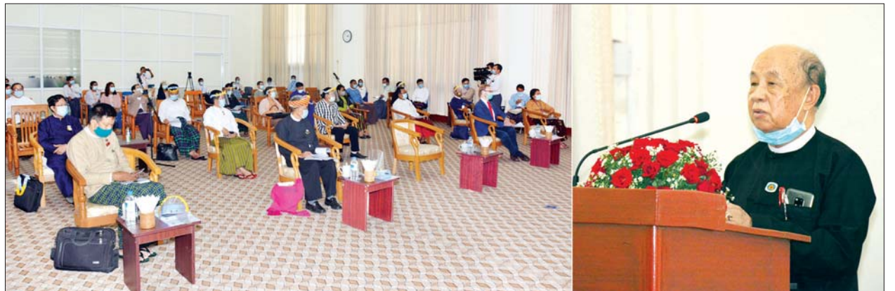
ပြည်သူ့လွှတ်တော် ဒုတိယဥက္ကဋ္ဌ ဦးထွန်းထွန်းဟိန် လွှတ်တော်ကိုယ်စားလှယ်များအတွက် မဲဆန္ဒနယ်ဆိုင်ရာ အချက်အလက်များ မိတ်ဆက်ခြင်း အခမ်းအနားတွင် အမှာစကားပြောကြားစဉ်။

အချက်အလက်များကို အနီးစပ်ဆုံး ပြုစုထားရှိပါကြောင်း၊ လွှတ်တော်ကိုယ်စားလှယ်များအနေဖြင့် မိမိတို့ မဲဆန္ဒနယ်များမှာ လိုအပ်သည့် လူဦးရေ သန်းခေါင်စာရင်း၊ ကျန်းမာရေး၊ ပညာရေး၊ စီးပွားရေး၊ မြေယာကိစ္စရပ်များကို အဓိကသတင်းအချက်အလက် အရင်းအမြစ် သုံးခုဖြစ်သည့် မြို့နယ်အထွေထွေအုပ်ချုပ်ရေးဦးစီးဌာန၊ ပြည်သူ့အင်အားဦးစီးဌာန၊ အလုပ်သမား လူဝင်မှုကြီးကြပ်ရေးနှင့် ပြည်သူ့အင်အားဦးစီးဌာန၊ ကုလသမဂ္ဂ လူဦးရေရန်ပုံငွေအဖွဲ့ (UNFPA) Website စာမျက်နှာများမှ ရယူပြီး UNDP/ IPU နှင့် လွှတ်တော်ရုံးများရှိ သုတေသနဌာနမှ ဝန်ထမ်းများ ပူးပေါင်း၍ အချက်အလက်များကို ရှာဖွေပြုစုထားရှိသည့် စာအုပ်