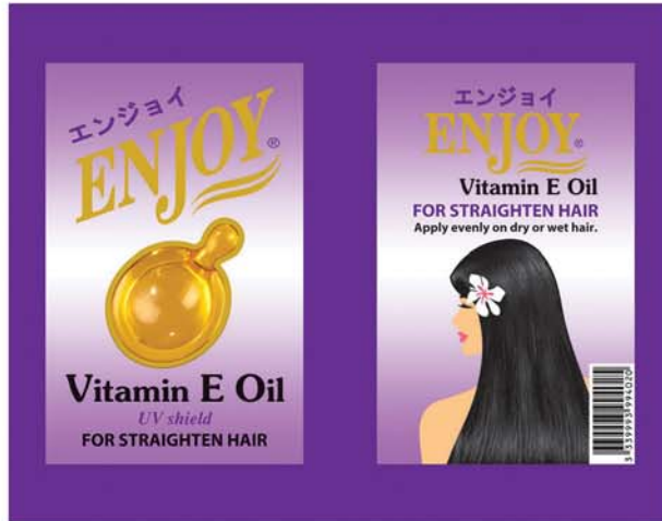
(၂၀၁၂ခုနှစ်)

ဖော်ပြပါ ကုန်သွယ်မှုအဆင်အပြင် (Trade Dress) ဖြစ်သော ကုန်ပစ္စည်းထုပ်ပိုးမှုပုံစံ (Product's Packaging Design) နှင့် တွဲဖက်အသုံးပြုထားသည့် ENJOY ကုန်အမှတ်တံဆိပ်ပါ Vitamin E Oil အလှကုန်ပစ္စည်းများ၏ ထူးခြားထင်ရှားကွဲပြားသော အိတ်ခွဲပုံစံဒီဇိုင်း၊ သီးသန့်ရွေးချယ်သုံးစွဲထားသည့် အရောင်အသွေး၊ ASEAN အလှကုန် စံနှုန်းများနှင့်အညီ ပါဝင်ပစ္စည်းအသုံးပြုမှုအရည်အသွေးစစ်မှန်ချက်၊ အများပြည်သူက လက်လှမ်းတမီ ဝယ်ယူအသုံးပြုနိုင်စေသည့်ဈေးနှုန်း၊ မိမိထုတ်ကုန်ပစ္စည်းအပေါ် အပြည့်အဝတာဝန်ယူမှုနှင့် အစဉ်မပြတ်တာဝန်ခံမှုတို့ဖြင့် ကျွန်ုပ်၏မိတ်ဆွေ၏ နှစ်ကာလများစွာ တစ်စိုက်မတ်မတ်ကြိုးပမ်းအားထုတ်မှုကြောင့် ENJOY အလှကုန်ပစ္စည်းများသည် ပြည်ထောင်စုသမ္မတမြန်မာနိုင်ငံတစ်ဝန်း သုံးစွဲသူပြည်သူအများ၏ ယုံကြည်စိတ်ချစွာ ဝယ်ယူအသုံးပြုမှုနှင့် တစ်ခဲနက်အားပေးထောက်ခံမှုတို့ကို ဂုဏ်ယူဝမ်းမြောက်စွာ လက်ခံရရှိလျက်ရှိပါသည်။