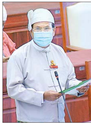
ဒုတိယဝန်ကြီး ဦးတင်မြင့်