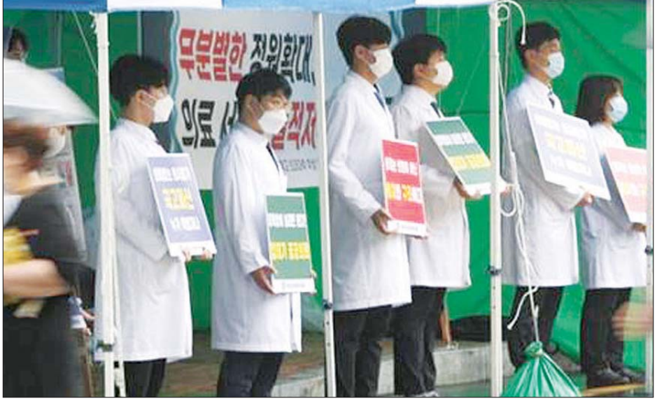
သပိတ်မှောက်နေကြသည့် ဆရာဝန်များကို တွေ့ရစဉ်။

အစိုးရ၏ကျန်းမာရေး စောင့်ရှောက်မှုပြုပြင်ပြောင်းလဲရေး အစီအစဉ်တွင် လာမည့် ၁၀ နှစ်အတွင်း ဆေးဘက်ဆိုင်ရာ ကျောင်းများတွင် ကျောင်းသားဦးရေ ၄၀၀၀ အထိ တိုးမြှင့်သွားရန် အဆိုပြုချက် ပါဝင် သည်။ သပိတ်မှောက်ဆရာဝန်များ ကမူ အစိုးရသည် ၎င်းတို့၏ အကြံပြုချက်ကို နားထောင်ခြင်းမရှိဘဲ အစီအစဉ် မူကြမ်းရေးဆွဲသည်ဟု ပြောသည်။ အစိုးရကမူ ဆရာဝန်များကို ကူးစက်မှုမြင့်တက်နေသည့် နေရာ များနှင့် ဆိုးလ်မြို့ဝန်းကျင်သို့ ပြန်လည်လုပ်ငန်းခွင်ဝင်ကြရန် အမိန့် ထုတ်ထားသည်။ အစိုးရ၏အမိန့်ကို မနာမာသည် ဆရာဝန်များ လိုင်စင်ရုပ်သိမ်းခံရ မည်ဟုလည်း အစိုးရက ပြောကြား ထားသည်။ အင်န်အိတ်ချ်ကေ