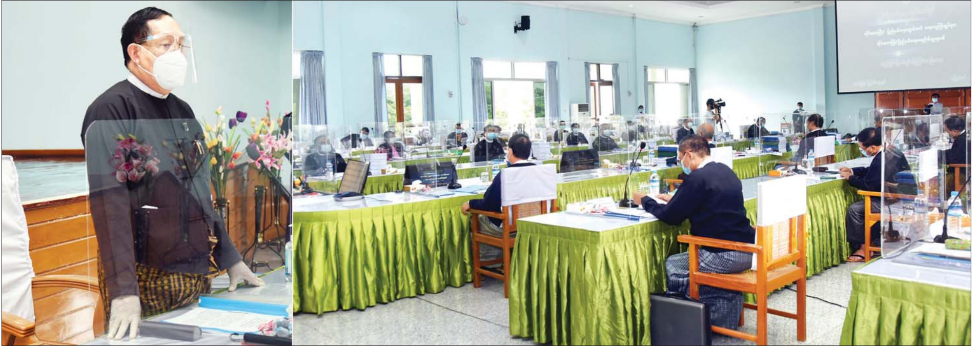
ပြည်ထောင်စုတရားသူကြီးချုပ် ဦးထွန်းထွန်းဦး တိုင်းဒေသကြီး/ပြည်နယ် တရားလွှတ်တော်များ၏ (၁၉) ကြိမ်မြောက် လုပ်ငန်းညှိနှိုင်းအစည်းအဝေးတွင် အမှာစကားပြောကြားစဉ်။