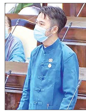
ရှမ်းပြည်နယ် မဲဆန္ဒနယ် အမှတ်(၁၁) မှ ဦးကျော်နီနိုင်

ဆောက်လုပ်ပေးရန် အစီအစဉ် ရှိ/မရှိ မေးခွန်းနှင့်စပ်လျဉ်း၍ ဒုတိယဝန်ကြီး ဦးဝင်းမော်ထွန်း က ကွန်ပျူတာတက္ကသိုလ်(စစ်တွေ)၌ ကျောင်းသား ကျောင်းသူ အိပ်ဆောင်တည်ဆောက်ရာတွင် တက္ကသိုလ်ဝင်းနှင့် တစ်ဆက်တစ်စပ်တည်း မြေနေရာရရှိပါက အဆင်ပြေဆုံးဖြစ်ပါကြောင်း၊ မရနိုင်ပါကလည်း မနီးလွန်း၊ မဝေးလွန်းသည့်နေရာများတွင် သင့်လျော်သည့် မြေနေရာရရှိရန် လိုအပ်ပါကြောင်း၊ မြေနေရာရရှိသည့်နှင့်တစ်ပြိုင်နက် အဆောင်ဆောက်လုပ်ရေးအတွက် ဘဏ္ဍာငွေထည့်သွင်းလျာထားဆောင်ရွက်ပေးမည်ဖြစ်ပါကြောင်း ဖြေကြားသည်။