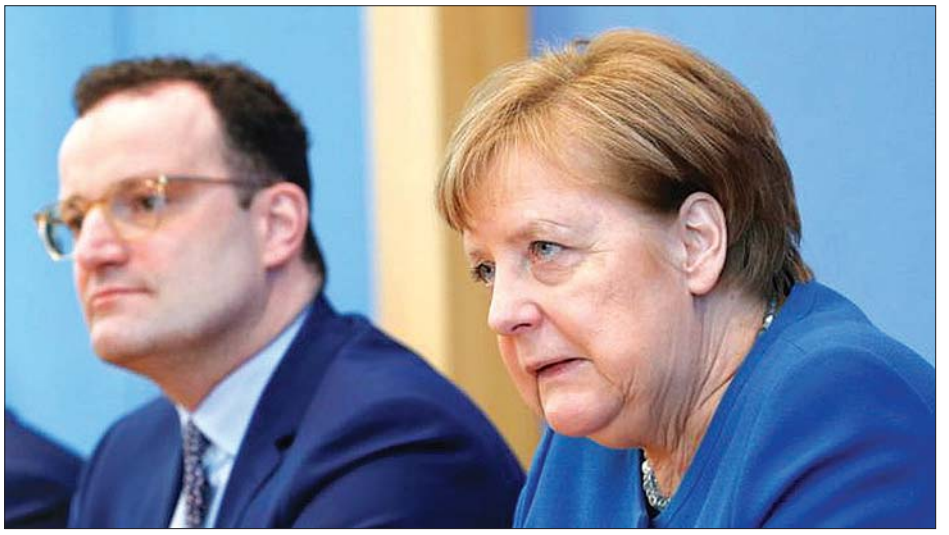
ဂျာမနီဝန်ကြီးချုပ် အင်ဂျလာမာကယ်နှင့် ကျန်းမာရေးဝန်ကြီးတို့ကို တွေ့ရစဉ်။

စည်းကမ်းချက် မူကြမ်းတွင် ထိတွေ့မှုရှိသည့် လူ အရေအတွက်လျော့ချနိုင်ရေး ပြည်သူများကို တိုက်တွန်း ထားပြီး ၁၃သမ ၅မီတာ အကွာတွင် ခပ်ခွာခွာနေထိုင်ကြရန် လည်းတိုက်တွန်းထားသည်။ အေအက်ဖ်ပီ