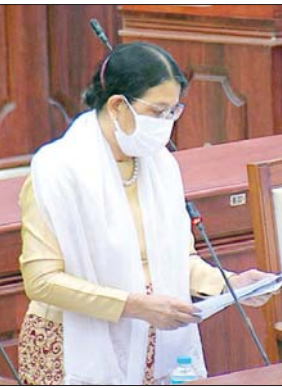
ဒုတိယဝန်ကြီး ဒေါက်တာဒေါ်မြလေးစိန်

ဆေးပညာရှင်တွေ၊ ဓာတ်ခွဲပညာရှင်တွေ၊ သဘာဝပတ်ဝန်းကျင်ဆိုင်ရာ ပညာရှင်တွေ၊ သုတေသနပညာရှင်တွေ စတဲ့သက်ဆိုင်ရာ နယ်ပယ်အသီးသီး က ပုဂ္ဂိုလ်တွေပေါင်းပြီးတော့ One Health National Strategic Plan နိုင်ငံတော်အဆင့် စီမံကိန်းချမှတ်ရေးဆွဲ အကောင်အထည်ဖော်ဆောင်ရွက်မှ အောင်မြင်နိုင်မှာဖြစ်တဲ့အတွက် ပြည်သူ့လွှတ်တော်ဥက္ကဋ္ဌကြီးမှတစ်ဆင့် ရိုသေလေးစားစွာ မေးမြန်းအပ်ပါတယ်။ အားလုံးကို ကျေးဇူးတင်ပါတယ်။