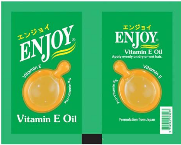
(၂၀၀၆ခုနှစ်)