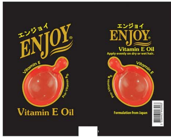
(၂၀၀၈ခုနှစ်)