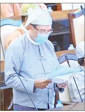
ဒုတိယဝန်ကြီး ဒေါက်တာကျော်လင်း

ရခိုင်ပြည်နယ် မဲဆန္ဒနယ်အမှတ် (၁၁) မှ ဒေါ်ထုမေ ၏ ရခိုင်ပြည်နယ်၊ စစ်တွေ ကွန်ပျူတာတက္ကသိုလ်တွင် တက်ရောက်နေကြသော ကျောင်းသားကျောင်းသူများ အဆင်ပြေစွာဖြင့် ပညာသင်ယူဆည်းပူးနိုင်ရန် လိုလောက်သော အဆောင် စီစဉ်ပေးနိုင်ရေးအတွက် လာမည့်နှစ်တွင် သင့်လျော်သော မြေနေရာအား သက်ဆိုင်ရာများမှ ပူးပေါင်းဆောင်ရွက်ပြီး အဆောင်တစ်ဆောင်