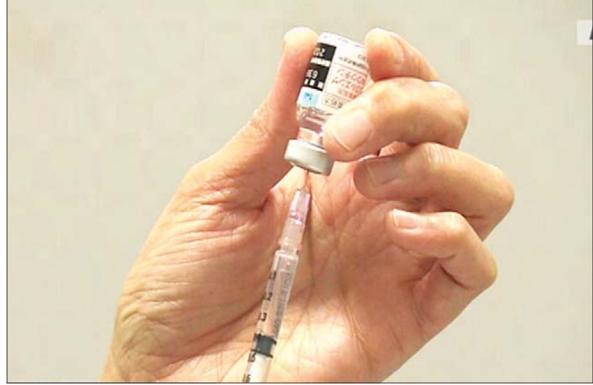
ရာသီတုပ်ကွေးကာကွယ်ဆေးကို တွေ့ရစဉ်။

ကိုဗစ်-၁၉ နှင့် ရာသီတုပ်ကွေးသည် ရောဂါ လက္ခဏာချင်းဆင်တူသလို အများလည်း မြင့်တက် နိုင်သည်။ ကျန်းမာရေးဝန်ကြီးဌာနအနေဖြင့် ရာသီ တုပ်ကွေးအချိန်မကျရောက်မီ ကိုဗစ်-၁၉ စစ်ဆေး မှုများကို အရှိန်မြှင့်လုပ်ဆောင်ရန် စီစဉ်ထားသည်။ အင်န်အိတ်ချ်ကေ