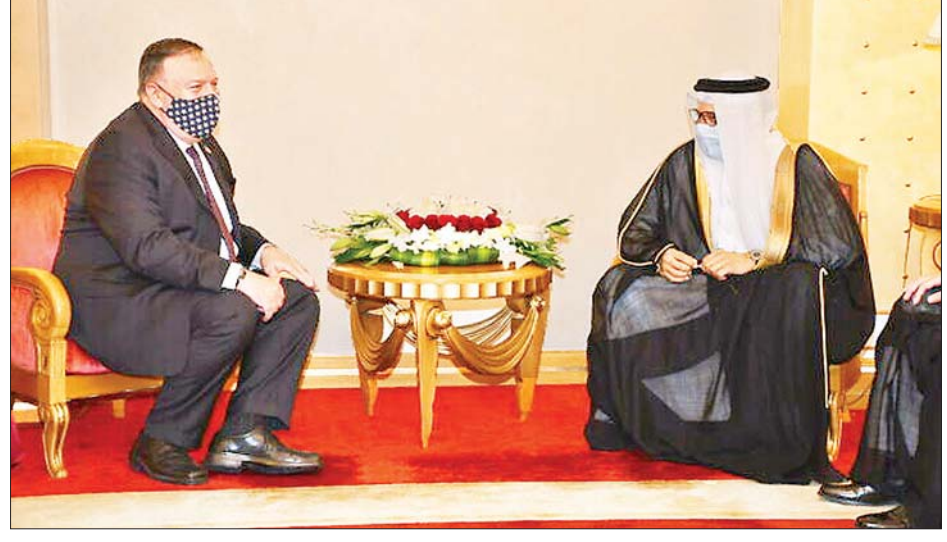
ဘာရိန်းနိုင်ငံခြားရေးဝန်ကြီး အဗ္ဗူဒူလာတစ်ဘင်ရာရှစ်အယ်ဇာရာနီနှင့် အမေရိကန်နိုင်ငံခြားရေးဝန်ကြီး မိုက်ပွန်ပီအိုတို့ တွေ့ဆုံကြစဉ်။