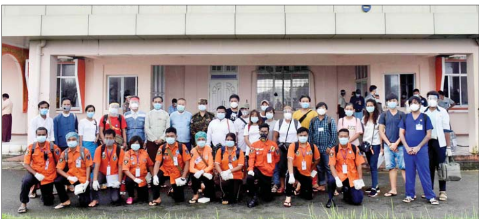
မိမိဆန္ဒအလျောက် ရခိုင်ပြည်နယ်တွင် တာဝန်ထမ်းဆောင်မည့် ရန်ကုန်တိုင်းဒေသကြီးအတွင်းမှ စေတနာ့ဝန်ထမ်းများအား တာဝန်ရှိသူများနှင့်အတူ စစ်တွေလေဆိပ်၌ တွေ့ရစဉ်။

ယခုသွားရောက်သည့် စေတနာ့ဝန်ထမ်းများမှာ ကိုဗစ် - ၁၉ ရောဂါ ကာကွယ်၊ ထိန်းချုပ်၊ ကုသ၊ တုံ့ပြန်ရေး လုပ်ငန်းစဉ်များတွင် အတွေ့အကြုံ ရှိပြီး Community Based Facility Quarantine Center များ၌ တာဝန်ထမ်းဆောင်ခဲ့ဖူးသူများဖြစ်ကာ အမျိုးသားအဆင့် စေတနာ့ဝန်ထမ်း ဦးဆောင်အဖွဲ့၏ အစီအစဉ်ဖြင့် စေတနာ့ဝန်ထမ်း ဆရာဝန်များက လေ့ကျင့်သင်ကြားပေးသော စေတနာ့ဝန်ထမ်းဆင့်ပွားသင်တန်းတက်ရောက် ပြီးသည့်သူများဖြစ်ကြသည်။ ရခိုင်ပြည်နယ်သို့ သွားရောက်သည့် စေတနာ့ဝန်ထမ်းများ၏ စားသောက်ရေး၊ နေထိုင်ရေး၊ သွားလာရေးနှင့် ကျန်းမာရေးဆိုင်ရာ ကိစ္စများအား အစိုးရက တာဝန်ယူ ဆောင်ရွက် ပေးသွားမည်ဖြစ်ပြီး အဆိုပါ စေတနာ့ဝန်ထမ်းများကို ကျန်းမာရေးနှင့် အားကစားဝန်ကြီးဌာနနှင့် ပူးပေါင်း၍ ဓာတ်ခွဲခွဲမှုမှာ များအား ဩဂုတ် ၂၆ ရက် နံနက်ပိုင်းတွင် စစ်ဆေးခဲ့ရာ ကျန်းမာရေးကောင်းမွန်သူများဖြစ်ကြောင်း သိရသည်။