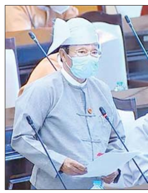
ဒုတိယဝန်ကြီး ဦးလှကျော်