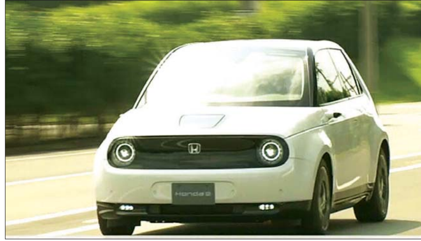
ဂျပန်ဟွန်ဒါကားကုမ္ပဏီက ထုတ်လုပ်လိုက်သော လျှပ်စစ်ကားကို တွေ့ရစဉ်။

မည်ဖြစ်ကြောင်းနှင့် ဂျပန်ယန်း ၄ ဒသမ ၅ သန်း သို့မဟုတ် အမေရိကန်ဒေါ်လာ ၄၃၀၀၀ ဖြင့် ရောင်းချမည်ဖြစ်ကြောင်း သိရသည်။ ကားထုတ်လုပ် ရေးကုမ္ပဏီက ယင်းကားကို တစ်နှစ်လျှင် အစီး ပေါင်း ၁၀၀၀ ထုတ်လုပ်နိုင်ရန် ရည်မှန်းထားကြောင်း သိရသည်။ အင်န်အိတ်ချ်ကေ