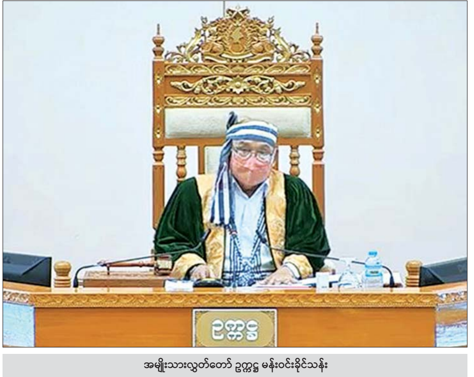
အမျိုးသားလွှတ်တော် ဥက္ကဋ္ဌ မန်းဝင်းခိုင်သန်း

နှင့် ပြည့်စုံသူ နေ့စား/လပေး ဝန်ထမ်းများကိုလည်း ဝင်ရောက်ယှဉ်ပြိုင်ဖြေဆိုစေ၍ ရွေးချယ်ခန့်ထားခြင်း များကို ဆောင်ရွက်နေပါကြောင်း။ ဌာန၏ လုပ်ငန်းလိုအပ်ချက်နှင့် ရာထူးနေရာ လစ်လပ်မှုအပေါ်မူတည်၍ သတ်မှတ်အရည်အချင်းများနှင့် ကိုက်ညီပြီး လုပ်ငန်းစွမ်းဆောင်ရည်ရှိသော နှစ်ရှည်လ များ ထမ်းဆောင်နေကြသည့် နေ့စား/လပေးများကို အမြဲတမ်းဝန်ထမ်းအဖြစ် ခန့်အပ်နိုင်ရန် နိုင်ငံဝန်ထမ်း ခန့်ထားခြင်းဆိုင်ရာမူဝါဒများ၊ နိုင်ငံဝန်ထမ်းဥပဒေ၊ နိုင်ငံ ဝန်ထမ်း နည်းဥပဒေများပါ ပြဋ္ဌာန်းချက်များနှင့်အညီ သက်ဆိုင်ရာပြည်ထောင်စုအဆင့် အဖွဲ့အစည်းများ၊ ပြည်ထောင်စုဝန်ကြီးဌာနများမှ ပြည်ထောင်စုအစိုးရ အဖွဲ့သို့ တင်ပြခွင့်ပြုချက် ရယူဆောင်ရွက်လျက်ရှိပါ ကြောင်း ဖြေကြားသည်။ စစ်ကိုင်းတိုင်းဒေသကြီး မဲဆန္ဒနယ်အမှတ်(၄)မှ ဦးလှဦး၏ စစ်ကိုင်းတိုင်းဒေသကြီး မုံရွာခရိုင် ချောင်းဦး မြို့နယ် စာမျက်နှာ ၈ ကော်လံ ၁ *