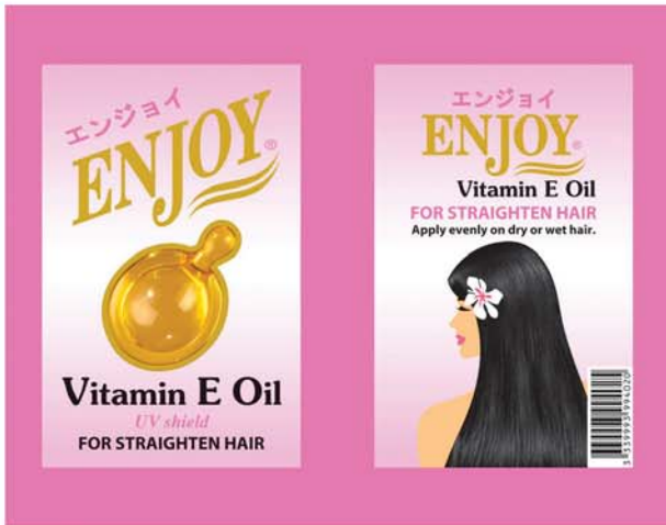
(၂၀၁၂ခုနှစ်)