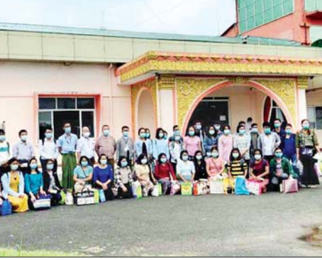
- ၂ (ဆေးဝါး) တစ်ဦး၊ သူနာပြု ၂၀ နှင့် သားဖွားဆရာမ သုံးဦးတို့ ပါဝင်ကြောင်း သိရသည်။ တင်ထွန်း (ပြန်/ဆက်)

တာဝန်ထမ်းဆောင်မည့် ကျန်းမာရေးဝန်ထမ်းများသည် နေပြည်တော်၊ ပဲခူးတိုင်းဒေသကြီးနှင့် မန္တလေးတိုင်းဒေသကြီးတို့ရှိ ကျန်းမာရေးနှင့် အားကစားဝန်ကြီးဌာန၊ ကျန်းမာရေးဌာနများတွင် တာဝန်ထမ်းဆောင်နေကြသူများဖြစ်ပြီး ညွှန်ကြားရေးမှူးတစ်ဦး၊ ဒုတိယညွှန်ကြားရေးမှူးတစ်ဦး၊ လက်ထောက်ဆရာဝန်ခြောက်ဦး၊ အထက်တန်းသူနာပြုငါးဦး၊ လက်ထောက် ကျန်းမာရေးမှူးတစ်ဦး၊ ဆေးဘက်ကျွမ်းကျင် - ၂ (ဓာတ်မှန်) နှစ်ဦး၊ ဆေးဘက်ကျွမ်းကျင်