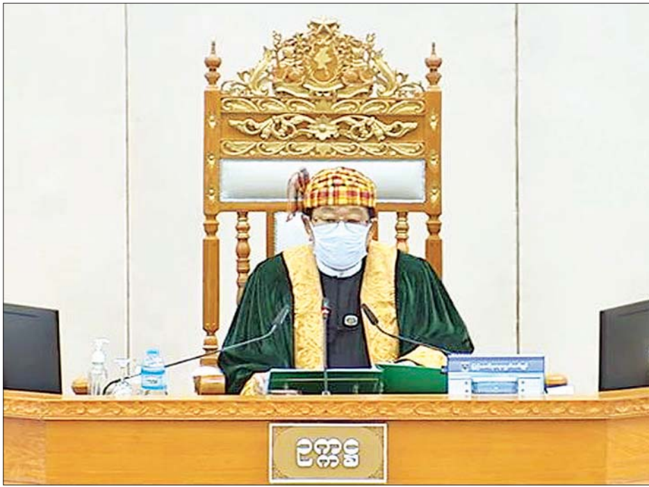
ပြည်သူ့လွှတ်တော်ဥက္ကဋ္ဌ ဦးတီခွန်မြတ်။