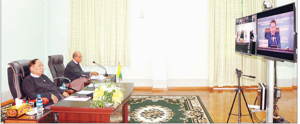
နိုင်ငံတော်ဖွဲ့စည်းပုံအခြေခံဥပဒေဆိုင်ရာ ခုံရုံးဥက္ကဋ္ဌ ဦးမျိုးညွန့် အာရှနိုင်ငံများ၏ ဖွဲ့စည်းပုံအခြေခံဥပဒေဆိုင်ရာ တရားရုံးများနှင့် အဆင့်တူအဖွဲ့အစည်းများအသင်း (AACC) အဖွဲ့ဝင်များ အစည်းအဝေးနှင့် စတုတ္ထအကြိမ် အပြည်ပြည်ဆိုင်ရာညီလာခံသို့ Video Conferencing ဖြင့် ပါဝင်ဆွေးနွေးခဲ့ပါ သတင်းစဉ်