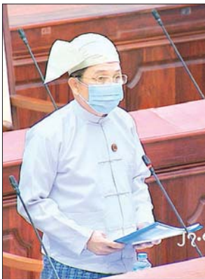
ဒုတိယဝန်ကြီး ဦးမြင့်ကြိုင်

ထို့နောက် မိတ္ထီလာမဲဆန္ဒနယ်မှ ဒေါက်တာမောင်သင်း တင်သွင်းသည့် ကမ္ဘာလုံးဆိုင်ရာကပ်ရောဂါဖြစ်သည့် COVID-19 ရောဂါကြောင့် မြန်မာနိုင်ငံ အတွင်း အလုပ်အကိုင်နှင့် စီးပွားရေးဂယက်ရိုက်ခတ်မှုသည် ကြီးမားပြင်းထန်ခြင်း