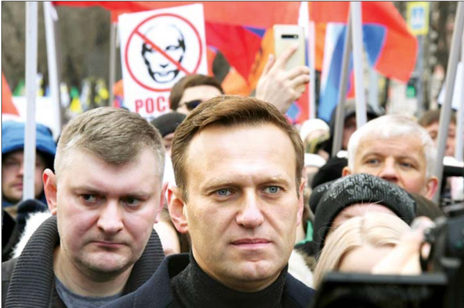
ရုရှားအတိုက်အခံခေါင်းဆောင် အလက်ဇီနာဗယ်နီ (လယ်)

မော်စကို ဩဂုတ် ၂၀ ရုရှားအတိုက်အခံခေါင်းဆောင် အလက်ဇီနာဗယ်နီသည် သံသယဖြစ်ဖွယ်အဆိပ်သင့်မှုဖြင့် ဆိုက်ဘေးရီးယားဒေသရှိ ဆေးရုံတစ်ခု၏ အထူးကြပ်မတ်ကုသဆောင်တွင် ဩဂုတ် ၂၀ ရက်က ဆေးကုသမှုခံယူလျက်ရှိကြောင်း ၎င်း၏ ပြောရေးဆိုခွင့်ရှိသူက ပြောကြားလိုက်သည်။