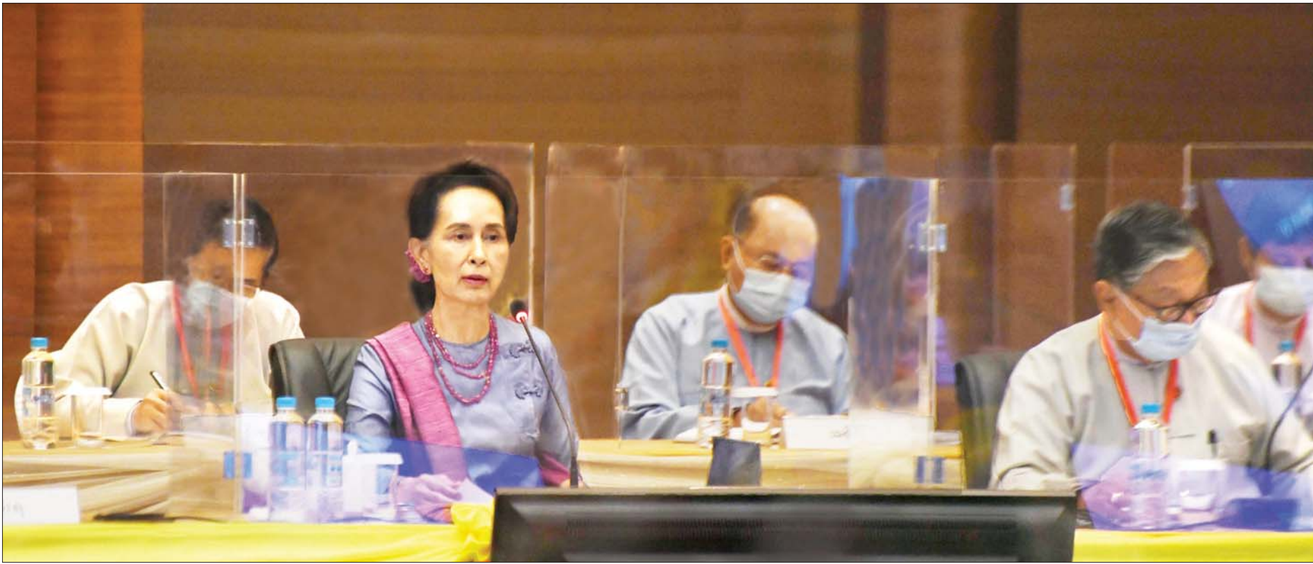
နိုင်ငံတော်၏အတိုင်ပင်ခံပုဂ္ဂိုလ် ဒေါ်အောင်ဆန်းစုကြည် အကြိမ် (၂၀) မြောက် ပြည်ထောင်စုငြိမ်းချမ်းရေးဆွေးနွေးမှုပူးတွဲကော်မတီ (UPDJC) အစည်းအဝေးတွင် မိန့်ခွန်းပြောကြားစဉ်။ သတင်းစဉ်

၁၃၈၂ ခုနှစ်၊ ဝါခေါင်လဆန်း ၃ ရက် ၂၀၂၀ ပြည့်နှစ်၊ ဩဂုတ် ၂၁ ရက်၊ သောကြာနေ့ အတွဲ (၅၅)၊ အမှတ် (၃၂၃)