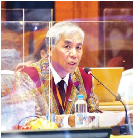
UPDJC ဒုတိယဥက္ကဋ္ဌ ဒေါက်တာဆလိုင်းလျန်မူန်းဆာခေါင်း

ထို့နောက် ပြည်ထောင်စုငြိမ်းချမ်းရေးဆွေးနွေးမှု ပူးတွဲကော်မတီ (UPDJC) ဒုတိယဥက္ကဋ္ဌ ပြည်ထောင်စု ဝန်ကြီး ဦးကျော်တင့်ဆွေက ဩဂုတ် ၂၀ ရက်တွင် ကျင်းပမည့် ညီလာခံ၌တင်သွင်းပြီး လက်မှတ်ရေးထိုး စာချုပ်ချုပ်ဆိုမည့် ပြည်ထောင်စုသဘောတူစာချုပ် အစိတ်အပိုင်း (၃)သည် နိုင်ငံတော်၏အတိုင်ပင်ခံပုဂ္ဂိုလ် ပြောကြားခဲ့သည့်အတိုင်း ၂၀၂၀ ပြည့်နှစ် အလွန် ကာလအတွက် လမ်းညွှန်ဖော်ပြပေးနိုင်ခဲ့ခြင်း ဖြစ်ပါ ကြောင်း၊ နိုင်ငံရေးဆွေးနွေးပွဲများသည် အမှန်တကယ် ထိရောက်မှုရှိပြီးအလုပ်ဖြစ်ခဲ့ပါကြောင်း၊ ယခင်က မစဉ်းစား ခဲ့ဖူးသည့် အကြောင်းအရာများကို ယနေ့ မိမိတို့ ဆွေးနွေးနေ ကြပြီဖြစ်ပါကြောင်း၊ သဘောတူညီချက်များရရှိအောင်