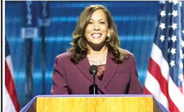
ဒုတိယသမ္မတလောင်းအဖြစ် တရားဝင်ရွေးချယ်ထားသော အမေရိကန် ဒီမိုကရက်ပါတီ လွှတ်တော်အမတ် ကမ်မလာဟားရစ်ကိုတွေ့ရစဉ်။

အိုဘားမားက ဘိုင်ဒင်သည် အမေရိကန်ကို အကောင်းဆုံးနိုင်ငံတစ်ခု ဖြစ်အောင် စွမ်းဆောင်ပေးနိုင်သည့် အရည်အချင်းနှင့် ဗီဇကွဲကွာများ ရှိကြောင်း ထောက်ခံသူများကို ပြောကြားလိုက်သည်။ အိုဘားမားက အစိုးရကိုပြောင်းလဲရန် တိုက်တွန်းပြောကြားလိုက်ပြီး အမေရိကန်ဒီမိုကရက်တစ်အဖွဲ့အစည်းကြီးသည် ယခင်က မကြုံဖူးခဲ့သည့် ခြိမ်းခြောက်မှုများနှင့် ကြုံတွေ့နေကြောင်း သတိပေးပြောကြားလိုက်သည်။ အင်န်အိတ်ချ်ကေ