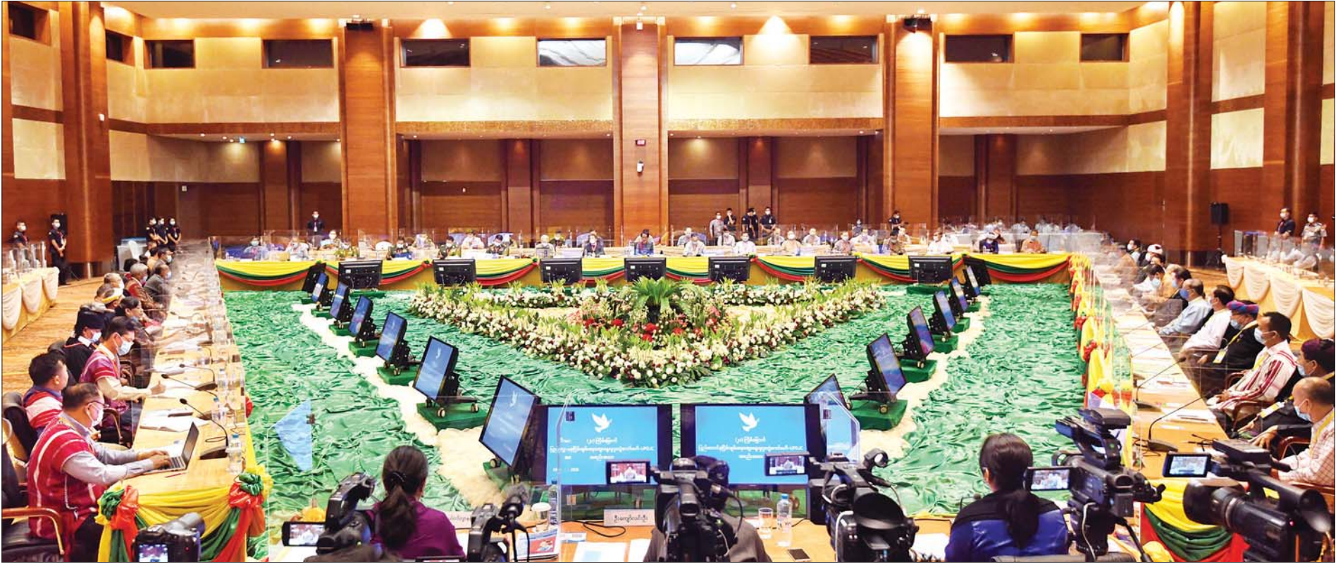
အကြိမ် (၂၀) မြောက် ပြည်ထောင်စုငြိမ်းချမ်းရေးဆွေးနွေးမှုပူးတွဲကော်မတီ (UPDJC) အစည်းအဝေး ကျင်းပစဉ်။