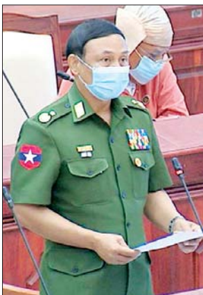
ပြည်ထဲရေးဝန်ကြီးဌာန ဒုတိယဝန်ကြီး ဗိုလ်ချုပ် စိုးတင်နိုင်

ဆက်လက်၍ ဖန်းမောက် မဲဆန္ဒနယ်မှ ဦးကျော်စိုး၏ ဖန်းမောက်မြို့နယ် အတွင်းရှိ ကျေးလက်လမ်းစာရင်းတွင် အမည်ပေါက်မပါဝင်သေးသော လမ်းများ နှင့် နိုင်ငံအဝန်း ကျေးလက်လမ်းစာရင်းတွင် ထည့်သွင်းရန် ကျန်ရှိသော မြို့နယ်များအား ကျေးလက်လမ်း ဖွံ့ဖြိုးရေးဦးစီးဌာနက အမည်ပေါက်စာရင်း ထည့်သွင်းပေးရန် အစီအစဉ်ရှိ၊ မရှိ မေးခွန်း၊ ညောင်တုန်းမဲဆန္ဒနယ်မှ ဦးအုန်းလွင်၏ ဧရာဝတီတံတား (ညောင်တုန်း)၊ မီးရထားတံတား တည်ဆောက် ခဲ့စဉ် ပျက်စီးကျန်ခဲ့သော လယ်မြေနှင့် ယာမြေများ၌ လုပ်ကိုင်စားသောက်ခဲ့ ကြသော တောင်သူများအား ၂၀၂၀-၂၀၂၁ ဘဏ္ဍာရေးနှစ်တွင် မြေယာလျော်ကြေး ပေးနိုင်ခြင်း ရှိ၊ မရှိ သိလိုခြင်း မေးခွန်းနှင့် အမရပူရမဲဆန္ဒနယ်မှ ဦးအောင် ဇော်ဖြင့်(ခ)ဦးစိုးမြင့်၏ အမရပူရမြို့နယ် ဆင်ရွာမြင်းမျိုးကျေးရွာရှိ ဝေရာစန ကျောက်စိမ်းစေတီတော် အဝင်လမ်းအား မည်သည့်အချိန်တွင် ဖောက်လုပ်ခွင့်