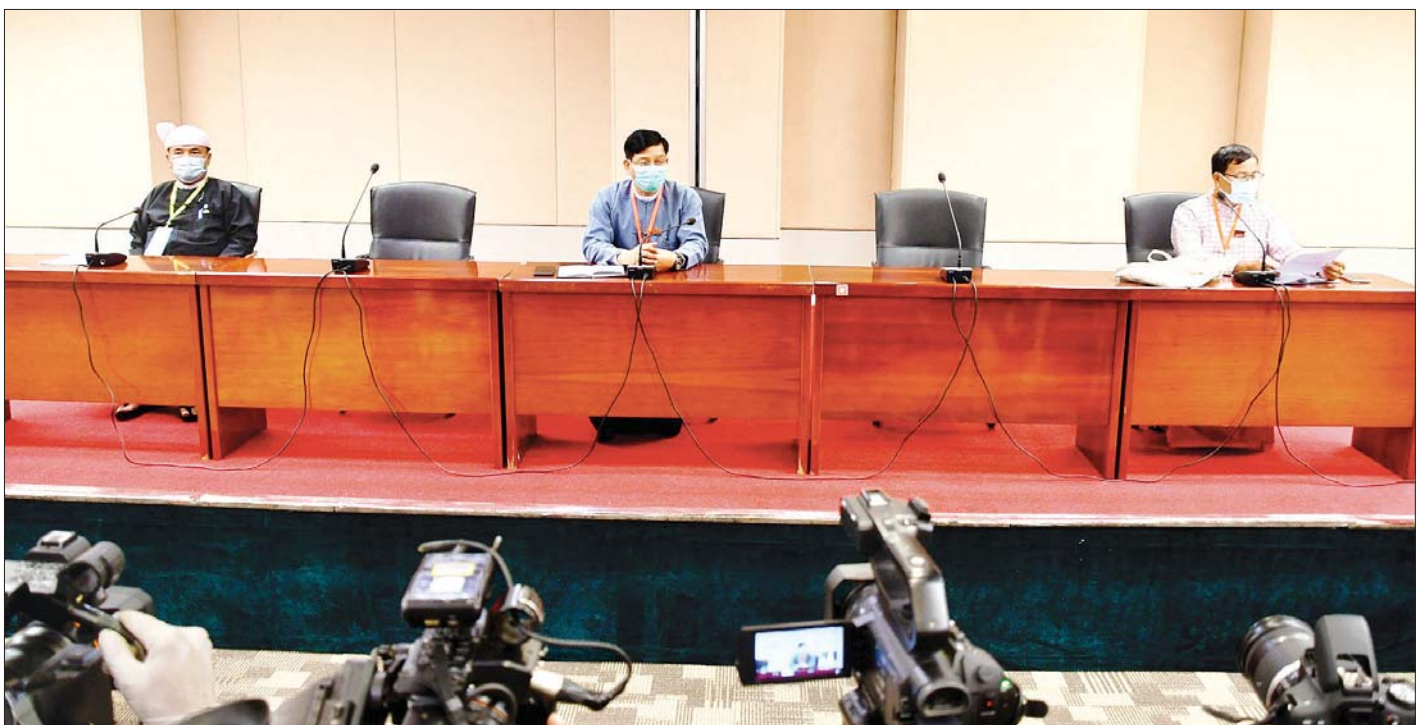
ပြည်ထောင်စုငြိမ်းချမ်းရေးညီလာခံ- (၂၁)ရာစုပင်လုံ စတုတ္ထအစည်းအဝေးနှင့်ပတ်သက်သည့် သတင်းစာရှင်းလင်းပွဲကျင်းပစဉ်။

အစိုးရအနေဖြင့် NCA လက်မှတ်ရေးထိုးထားခြင်း မရှိသေးသည့် တိုင်းရင်းသား လက်နက်ကိုင် အဖွဲ့အစည်း များ ငြိမ်းချမ်းရေးဖြစ်စဉ်တွင် ပါဝင်လာနိုင်ရေး အစိုးရ ဆောင်ရွက်နေမှုများနှင့်ပတ်သက်သည့် မေးမြန်းမှုအပေါ် ဦးစေဌေးက “နှစ်ဖက်စလုံးက တွေ့ဆုံဖို့ ညှိနှိုင်းတော့မယ်။ နောက်ဆုံးလာတဲ့ KIA+3 လေးဖွဲ့ရဲ့ Position နဲ့ သူတို့ရဲ့ သဘောထားကို ကျွန်တော်တို့ဘက်က တင်သွင်းလာတဲ့ အခါမှာ ကျွန်တော်တို့ဘက်မှာလည်း အစိုးရ၊ တပ်မတော်၊ လွှတ်တော် ပြန်ထိုင်ဖို့လိုတယ်။ အဲဒီအတွက်လည်း ကျွန်တော်တို့ စိစစ်နေတယ်။ အထူးသဖြင့် ဒီအဖွဲ့တွေထဲမှာ ထူးခြားချက်တွေ ပါနေတဲ့အတွက် ညီလာခံကို ဖိတ်ကြား တာကအစ အကန့်အသတ်တွေလုပ်ရတဲ့ အနေအထားလေး တွေ ရှိလာတယ်။ ဒါကြောင့် ဒီလေးဖွဲ့နဲ့ ဆွေးနွေးဖို့က