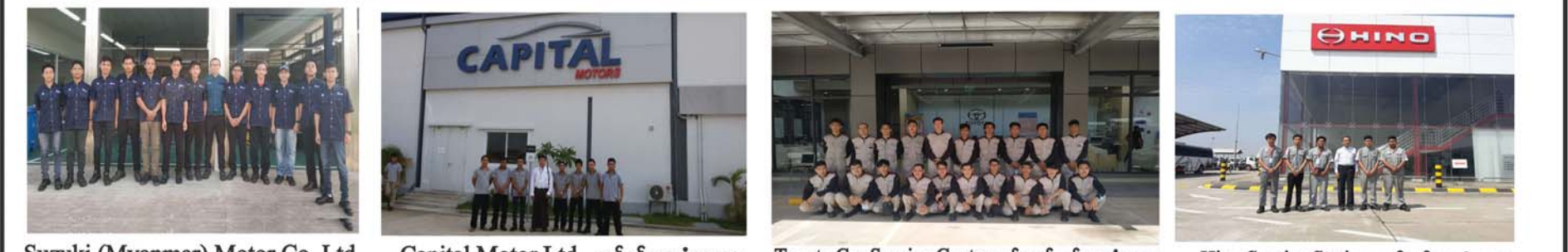
Suzuki (Myanmar) Motor Co. Ltd, Capital Motor Ltd, တွင်ခန့်ထားခံရသော GLORY ကျောင်းဆင်းများ Toyota Car Service Centre တစ်ခုတွင် ခန့်ထားခံရသော GLORY ကျောင်းဆင်းများ Hino Service Station တွင် ခန့်ထားခံရသော GLORY ကျောင်းဆင်းများ

မော်ပြပါ သင်တန်းအတွက် Scholar ပေးအပ်ရန်ရှိပြီး (10.9.2020) မတိုင်ခင် GLORY ကိုဆက်သွယ် လျှောက်ထားနိုင်ပါသည်။ . . .