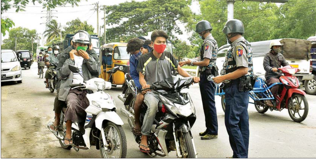
စာမျက်နှာ ၈ ကော်လံ ၁

မြို့မဈေးကြီး၌ ကိုဗစ်-၁၉ ရောဂါ ကာကွယ်ထိန်းချုပ်ရေးအတွက် ပါးစပ်နှင့်နှာခေါင်းစည်းများ အခမဲ့ဖြန့်ဝေခြင်းနှင့် အသိပညာပေးခြင်း များကို ယနေ့နံနက်ပိုင်းက ဆောင်ရွက်သည်။ (အောက်ပုံ) စစ်တွေမြို့တွင် ဈေးရောင်းချသည့် ဈေးသူ ဈေးသားများနှင့် ဈေးလာရောက်ဝယ်ကြသည့် ပြည်သူများအား ကိုဗစ်-၁၉ ရောဂါ