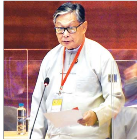
UPDJC ဒုတိယဥက္ကဋ္ဌ ပြည်ထောင်စုဝန်ကြီး ဦးကျော်တင့်ဆွေ

၂၀၂၀ အလွန် နိုင်ငံရေးဆွေးနွေးပွဲများ အရှိန်အဟုန် မြှင့်တင်ရေးသည် အလွန်အရေးကြီးပါကြောင်း၊ ထို့ကြောင့် မိမိတို့ UPDJC ၏ ရည်မှန်းချက်နှင့် တာဝန်သည် အထူး အရေးကြီးသည်ဟု ဆိုနိုင်ပါကြောင်း၊ မိမိတို့နိုင်ငံတွင် ဖြစ်ပွားနေသည့် လက်နက်ကိုင်ပဋိပက္ခများ ချုပ်ငြိမ်းနိုင်ရေး သည်လည်း UPDJC ၏ ကြိုးပမ်းအားထုတ်မှုများပေါ်တွင် တည်ရှိနေပါကြောင်း၊ ၂၀၂၀ အလွန် ကာလတွင်လည်း UPDJC သည် ဆက်လက်ရှိနေမည်ဖြစ်ပြီး နိုင်ငံရေး ပြဿနာများကို အဖြေထုတ်ပေးနိုင်ရန်အတွက် ဆက်လက် ကြိုးပမ်းနေမည် ဖြစ်ပါကြောင်း၊ UPDJC တွင် ပါဝင်သည့် အစုအဖွဲ့ ကိုယ်စားလှယ်တချို့ ပြောင်းလဲကောင်း ပြောင်းလဲသွားနိုင်ပါကြောင်း၊ အဖွဲ့ဝင်များ မည်သို့ပြောင်းလဲ သည်ဖြစ်စေ ယနေ့ မိမိတို့ တည်ဆောက်ထားသည့် UPDJC စိတ်ဓာတ်သည် မပြောင်းလဲဘဲ ဆက်လက်တည်ရှိ နေမည် ဖြစ်ပါကြောင်း၊ ယင်းစိတ်ဓာတ်ဖြင့်