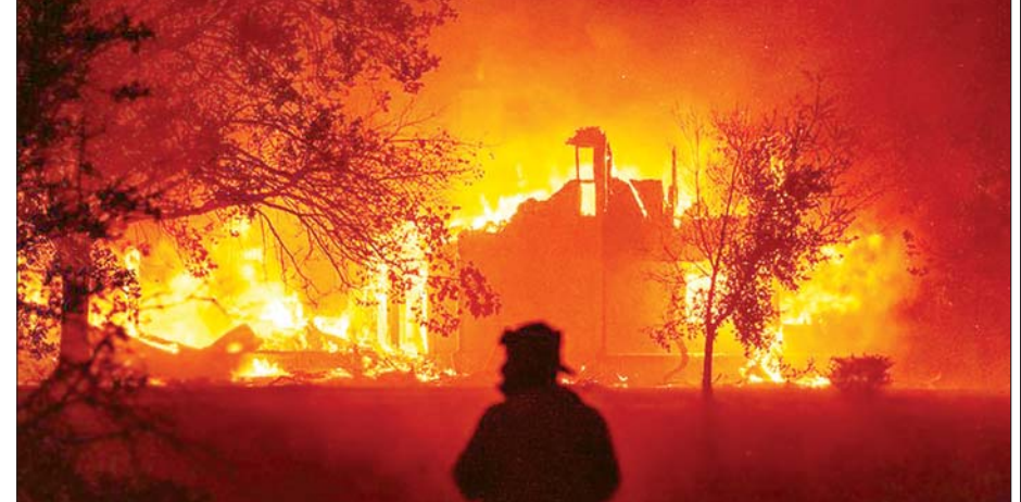
ကယ်လီဖိုးနီးယားပြည်နယ်၌ အဆောက်အအုံတစ်ခု တောမီးကူးစက်လောင်ကျွမ်းနေသည်ကို တွေ့ရစဉ်။

သည့် အနက်ရောင်မီးခိုးလုံးများ ကောင်းကင်တစ်ခွင် ပျံလွင့်နေသည့် မြင်ကွင်းကို သတင်းဓာတ်ပုံအချို့ တွင် ဖော်ပြထားသည်။ အင်န်အိတ်ချ်ကေ