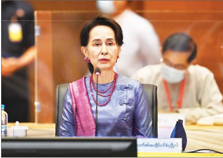
ပြည်ထောင်စုငြိမ်းချမ်းရေးဆွေးနွေးမှုပူးတွဲကော်မတီ UPDJC ဥက္ကဋ္ဌ၊ နိုင်ငံတော်၏အတိုင်ပင်ခံပုဂ္ဂိုလ် ဒေါ်အောင်ဆန်းစုကြည် အကြိမ်(၂၀)မြောက် ပြည်ထောင်စုငြိမ်းချမ်းရေးဆွေးနွေးမှုပူးတွဲကော်မတီ (UPDJC) အစည်းအဝေးတွင် မိန့်ခွန်းပြောကြားစဉ်။

ကျွန်မတို့ရဲ့ လုပ်ငန်းလမ်းညွှန် (TOR) တွေနဲ့ လုပ်ထုံးလုပ်နည်း (SOP) တွေဟာ နိုင်ငံရေးဆွေးနွေးမှု မူဘောင်ကိုအခြေခံပြီး ရေးဆွဲထားတာ ဖြစ်တဲ့အတွက် အစည်းအဝေးနဲ့ ဆွေးနွေးပွဲကျင်းပရေးနဲ့ သက်ဆိုင်တာတွေကို ပိုမိုများပြားနေပါတယ်။ ဒါဟာလည်း ပြည်ထောင်စုသဘောတူစာချုပ်မှာ အခြေခံမူတွေ ရယူနိုင်ရေးကို ဦးတည်ခဲ့တဲ့အတွက် ဒီလိုပုံစံမျိုး ဖြစ်နေကြတာပါ။ ရှေ့ဆက်မယ့် UPDJC ရဲ့ လုပ်ငန်းစဉ်တွေကို မျှော်ကြည့်လိုက်ရင် အခုညီလာခံမှာ လက်မှတ်ရေးထိုး စာချုပ်ချုပ်ဆိုမယ့် ၂၀၂၀ အလွန်အဆင့်လိုက် လုပ်ငန်းစဉ်တွေနဲ့ အဆင့်လိုက် အကောင်အထည်ဖော်မှုတွေနဲ့ လိုက်လျောညီထွေဖြစ်မယ့် နိုင်ငံရေးဆွေးနွေးမှုဆိုင်ရာမူဘောင်ကို ဦးစားပေးရေးဆွဲရမှာ ဖြစ်ပါတယ်။ အဆင့်လိုက်ဆွေးနွေးမှုတွေ ဆက်လက်