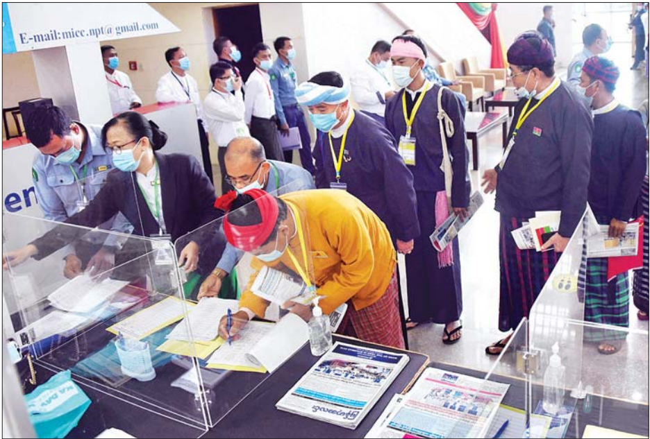
ပြည်ထောင်စုငြိမ်းချမ်းရေး ညီလာခံ - (၂၁) ရာစုပင်လုံ စတုတ္ထအစည်းအဝေးသို့ တက်ရောက်သူများ တက်ရောက်ကြောင်း လက်မှတ်ရေးထိုးစဉ်။