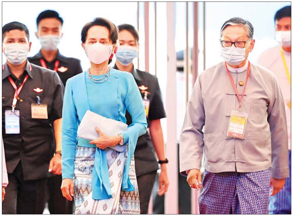
နိုင်ငံတော်၏အတိုင်ပင်ခံပုဂ္ဂိုလ် ဒေါ်အောင်ဆန်းစုကြည် ပြည်ထောင်စုငြိမ်းချမ်းရေးညီလာခံ-(၂၁) ရာစုပင်လုံ စတုတ္ထ အစည်းအဝေးဖွင့်ပွဲ အခမ်းအနားသို့ တက်ရောက်လာစဉ်။ သတင်းစဉ်