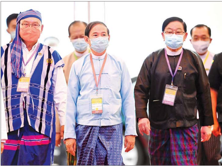
နိုင်ငံတော်သမ္မတ ဦးဝင်းမြင့် ပြည်ထောင်စုငြိမ်းချမ်းရေးညီလာခံ-(၂၁) ရာစုပင်လုံ စတုတ္ထအစည်းအဝေးဖွင့်ပွဲ အခမ်းအနားသို့ တက်ရောက်လာစဉ်။ သတင်းစဉ်