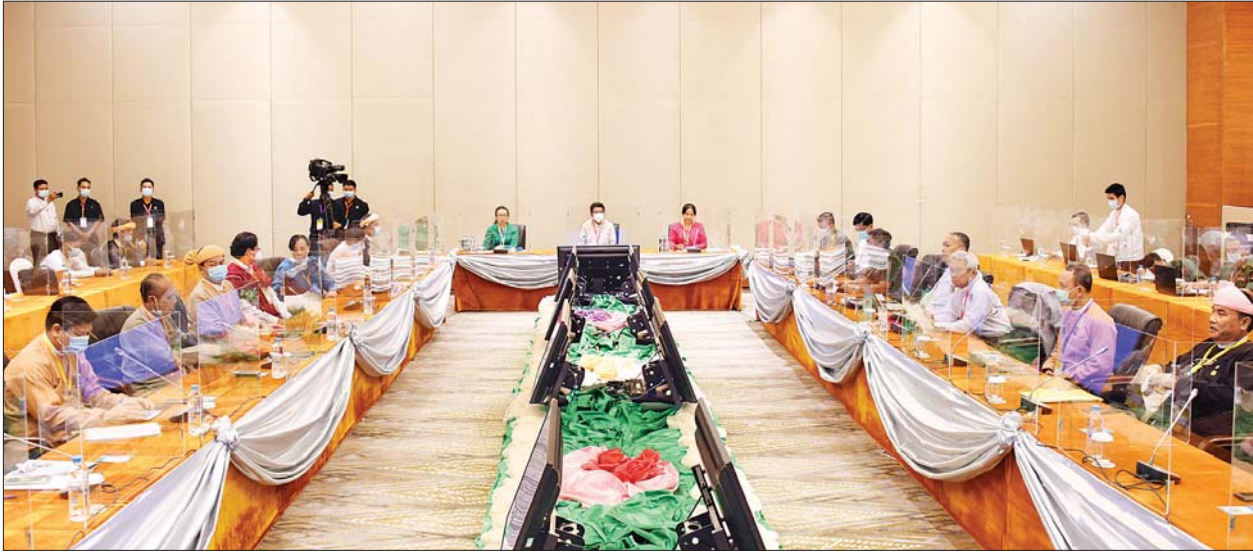
(၂၈) ကြိမ်မြောက် ပြည်ထောင်စုငြိမ်းချမ်းရေးဆွေးနွေးမှု ပူးတွဲကော်မတီ (UPDJC) အတွင်းရေးမှူးများ အစည်းအဝေးကျင်းပစဉ်။ သတင်းစဉ်

နေပြည်တော် ဩဂုတ် ၁၉ (၂၈) ကြိမ်မြောက် ပြည်ထောင်စု ငြိမ်းချမ်းရေးဆွေးနွေးမှု ပူးတွဲ ကော်မတီ (UPDJC) အတွင်းရေးမှူး များ အစည်းအဝေးကို ယနေ့မနက် ၂ နာရီခွဲတွင် နေပြည်တော်ရှိ မြန်မာ အပြည်ပြည်ဆိုင်ရာ ကွန်ဗင်းရှင်းဗဟို ဌာန-၁ (MICC-1)၌ ကျင်းပသည်။