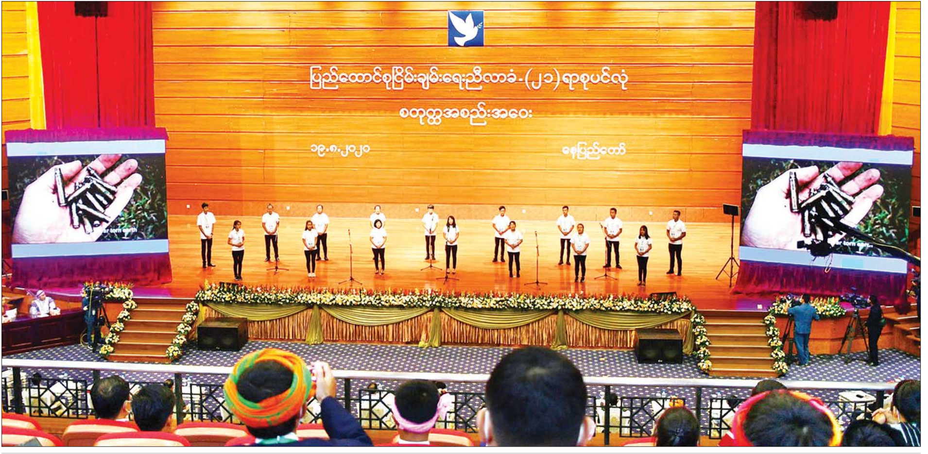
ကယားပြည်နယ် ငြိမ်းချမ်းရေးလူငယ်အဖွဲ့က မငြိမ်းချမ်းလို့မဖြစ်ဘူး တေးသီချင်းဖြင့် ဖျော်ဖြေတင်ဆက်စဉ်။ သတင်းစဉ်

အခမ်းအနားအပြီးတွင် နိုင်ငံတော်သမ္မတ ဦးဝင်းမြင့်၊ နိုင်ငံတော်၏အတိုင်ပင်ခံပုဂ္ဂိုလ် ဒေါ်အောင်ဆန်းစုကြည်၊ ဒုတိယသမ္မတများဖြစ်ကြသည့် ဦးမြင့်ဆွေနှင့် ဦးဟင်နရီဗန်ထီးယူ၊ ပြည်သူ့လွှတ်တော်ဥက္ကဋ္ဌ ဦးတီခွန်မြတ်၊ အမျိုးသားလွတ်တော်ဥက္ကဋ္ဌ မန်းဝင်းခိုင်သန်း၊ တပ်မတော်ကာကွယ်ရေးဦးစီးချုပ် ဗိုလ်ချုပ်မှူးကြီး မင်းအောင်လှိုင်၊ ဒုတိယတပ်မတော်ကာကွယ်ရေးဦးစီး ချုပ် ကာကွယ်ရေးဦးစီးချုပ်(ကြည်း) ဒုတိယဗိုလ်ချုပ်မှူးကြီး စိုးဝင်း၊ အမျိုးသားလွတ်တော် ဒုတိယဥက္ကဋ္ဌ ဦးအေးသာ အောင်၊ ပြည်ထောင်စုဝန်ကြီး ဦးကျော်တင်ဆွေ၊ ငြိမ်းချမ်း ရေးကော်မရှင်ဥက္ကဋ္ဌ ဒေါက်တာတင်မျိုးဝင်း၊ ဦးသန်းဌေး (USDPA)၊ ဦးသိန်းထွန်း (NUP)၊ ကရင် အမျိုးသား အစည်းအရုံး (KNU) ဥက္ကဋ္ဌ စောမူတူးစေးဖိုး၊ ဒီမိုကရေစီ အကျိုးပြု ကရင်တပ်မတော်(DKBA)မှ စောမိုးရှေး၊ ကရင်အမျိုးသား စာမျက်နှာ ၄ သို့