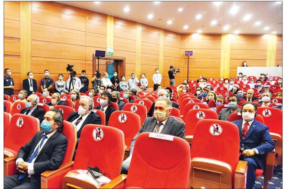
ပြည်ထောင်စုငြိမ်းချမ်းရေးညီလာခံ - (၂၁) ရာစုပင်လုံ စတုတ္ထအစည်းအဝေးဖွင့်ပွဲ အခမ်းအနားသို့ တက်ရောက်သူများကို တွေ့ရစဉ်။ သတင်းစဉ်