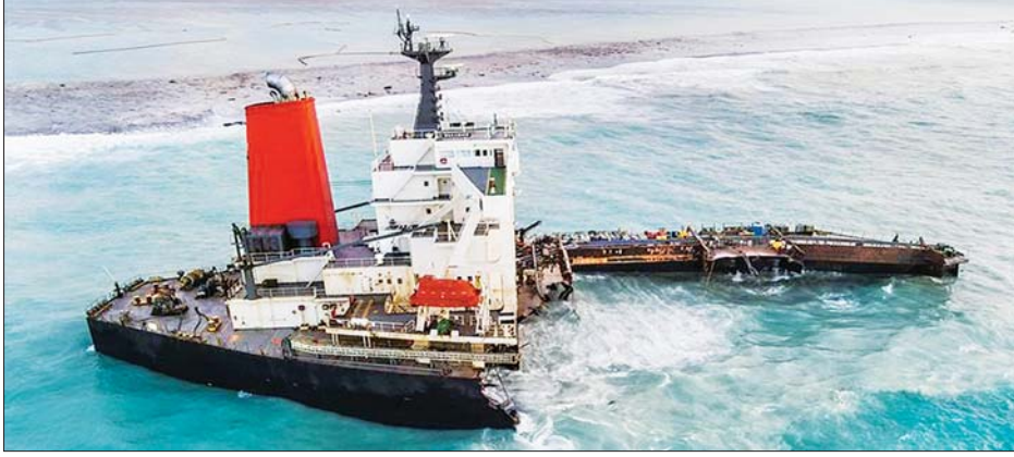
သောင်တင်ပြီး ကျန်ရစ်နေသည့် ဂျပန်ပိုင်ကုန်တင်သင်္ဘော ဝါကာရီယို