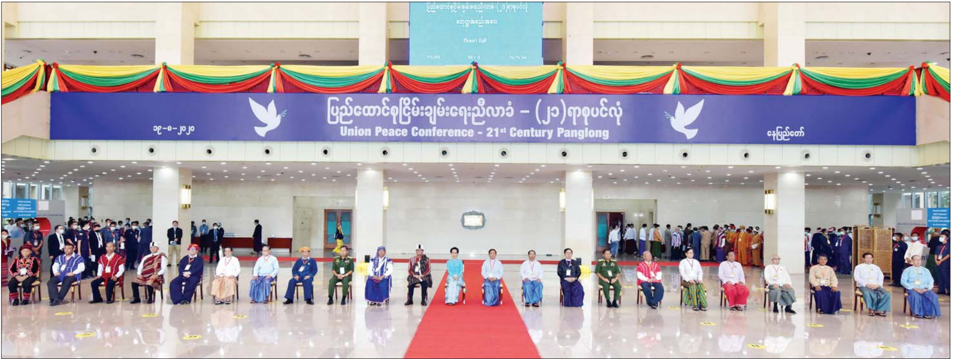
စာမျက်နှာ ၃ မှ

အစည်းအရုံး၊ ကရင်အမျိုးသားလွတ်မြောက်ရေး တပ်မတော် (ငြိမ်းချမ်းရေးကောင်စီ) (KNU/KNLA) (PC) ဥက္ကဋ္ဌ စောထွေးလေး၊ မြန်မာနိုင်ငံလုံးဆိုင်ရာ ကျောင်းသား