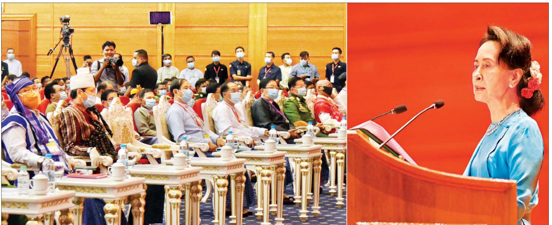
နိုင်ငံတော်၏အတိုင်ပင်ခံပုဂ္ဂိုလ် ဒေါ်အောင်ဆန်းစုကြည် ပြည်ထောင်စုငြိမ်းချမ်းရေးညီလာခံ - (၂၁) ရာစုပင်လုံ စတုတ္ထအစည်းအဝေး ဖွင့်ပွဲအခမ်းအနားတွင် မိန့်ခွန်းပြောကြားစဉ်။ သတင်းစဉ်