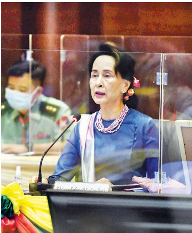
ပြည်ထောင်စုငြိမ်းချမ်းရေးဆွေးနွေးမှုပူးတွဲကော်မတီဥက္ကဋ္ဌ၊ နိုင်ငံတော်၏အတိုင်ပင်ခံပုဂ္ဂိုလ် ဒေါ်အောင်ဆန်းစုကြည် (၁၉)ကြိမ်မြောက် ပြည်ထောင်စုငြိမ်းချမ်းရေးဆွေးနွေးမှုပူးတွဲကော်မတီ (UPDJC)အစည်းအဝေးတွင် မိန့်ခွန်းပြောကြားစဉ်။

ဒီကနေ့ အစည်းအဝေးမှာ ပထမဆုံးပြောကြားလိုတဲ့ အချက်ကတော့ ကျွန်ုပ်တို့ UPDJC ရဲ့ အခန်းကဏ္ဍပဲ ဖြစ်ပါတယ်။ နိုင်ငံရေးဆွေးနွေးပွဲအဆင့်ဆင့်ကို ဦးဆောင်ကြီးကြပ်လမ်းညွှန်ဖို့ တာဝန်ယူခဲ့ရတဲ့ ကျွန်ုပ်တို့ရဲ့ UPDJC ဟာ သမိုင်းနဲ့ယှဉ်ပြီး ကြီးလေးတဲ့တာဝန်ကြီးတွေကို ထမ်းဆောင်နေကြရတာ ဖြစ်ပါတယ်။ နိုင်ငံရေးဆွေးနွေးပွဲတွေကို အဓိကတာဝန်ယူရတယ်ဆိုပေမယ့် နိုင်ငံရေးပြဿနာတွေနဲ့အတူ ဖြစ်ပွားလာခဲ့တဲ့ လက်နက်ကိုင်ပဋိပက္ခချုပ်ငြိမ်းရေးနဲ့ အမျိုးသားပြန်လည်ရင်ကြားစေရေးကိုလည်း ထည့်သွင်းစဉ်းစားရတာ ဖြစ်ပါတယ်။ UPDJC က တာဝန်ယူရတဲ့ နိုင်ငံရေးဆွေးနွေးပွဲတွေ အောင်မြင်ရေးဟာ UPDJC မှာ ပါဝင်နေတဲ့ အစုအဖွဲ့ခေါင်းဆောင်တွေ၊ ကိုယ်စားလှယ်တွေပေါ်မှာ အများကြီးမူတည်နေပါတယ်။ စေ့စပ်ညှိနှိုင်းရတဲ့ နိုင်ငံရေးစားပွဲပိုင်းကို ရောက်လာရင် စေ့စပ်ညှိနှိုင်းမှုတွေ အမှန်တကယ်လုပ်နိုင်ဖို့က လိုပါတယ်။ ကိုယ့်ရပ်တည်ချက်၊ ကိုယ့်မူဝါဒကိုပဲ တင်းတင်းမာမာဆုပ်ကိုင်ထားပြီး အပေးအယူ၊ အလျှော့အတင်းတစ်စုံတစ်ရာမှ လုပ်ကိုင်နိုင်စွမ်းမရှိဘူးဆိုရင် UPDJC ရဲ့ အနှစ်သာရဟာလည်း အချည်းနှီးပဲဖြစ်နေမှာ သေချာပါတယ်။ မတူညီတဲ့ အစုအဖွဲ့တွေကို ကိုယ်စားပြုကြရသူတွေဖြစ်ကြတဲ့အတွက် မတူညီတဲ့ သဘောထားတွေ၊ ကွဲပြားတဲ့မြင်ချက်တွေ၊ ခြားနားတဲ့ မျှော်မှန်းချက်တွေ