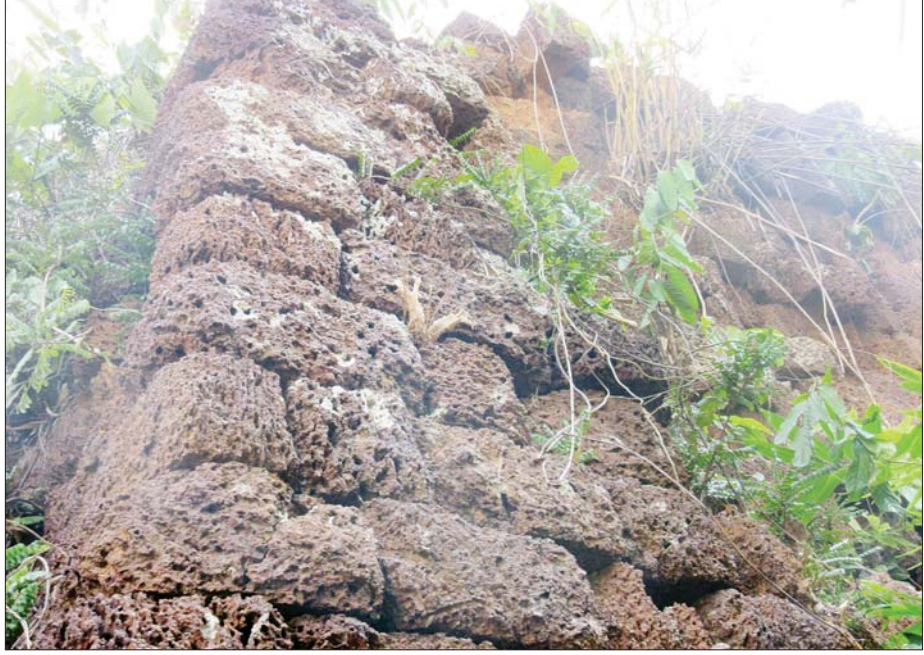
တနင်္သာရီမြို့ဟောင်း အပိုင်းအစများကို တွေ့ရစဉ်။

ပြည်ထဲရေးဝန်ကြီးဌာန၏ မှတ်တမ်းတွင် တနင်္သာရီမြို့ဟောင်း၊ မြို့ရိုးနှင့် ကျုံး၊ ရှင်မအောင်သာကျောက်တိုင်နှင့် နန်းတော်ရာကုန်းတို့ကို ရှေးဟောင်းနေရာတည်ရှိရာ ဇန်နီဟုလည်းကောင်း၊ တနင်္သာရီမြို့ဟောင်းအတွင်းအပြင် နှစ်ခုလုံးကို ကာကွယ်ထိန်းသိမ်းထားသောဇန်နီဟု လည်းကောင်း ဖော်ပြထားသည်။ တနင်္သာရီမြို့ရှိ မြေဝတ်ဆင်နှင့် ရန်အောင်မြင်တို့သည် မြို့နယ်၏ ထင်ရှားသော စေတီများဖြစ်ကြသည်။