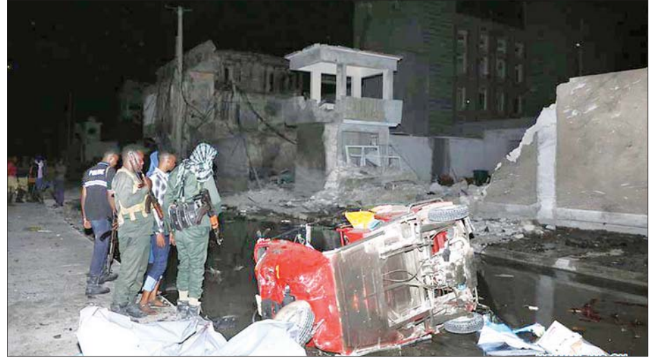
ဆိုမာလီဟိုတယ်တွင် စစ်သွေးကြွများ ဗုံးဖောက်ခဲ့သည့် နေရာ၌ ထိခိုက်ပျက်စီးမှုကို တွေ့ရစဉ်။

တွင် ထိခိုက်ဒဏ်ရာရရှိသူ ၂၈ ဦး ရှိကြောင်း၊ ၎င်းတို့ကို ဆေးရုံသို့ မြန်မြန်ဆန်ဆန် ပို့ဆောင်ခဲ့ကြောင်း သိရသည်။