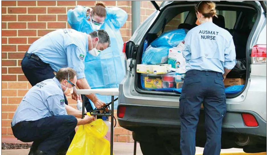
ကိုဗစ်-၁၉ တိုက်ဖျက်ရေးအတွက် လှုပ်ရှားနေကြသည့် ကျန်းမာရေးဝန်ထမ်းများကို တွေ့ရစဉ်။

နောက်ထပ်ကူးစက်ခံရသူ ၂၉၀ တွင် ဗစ်တိုးရီးယားပြည်နယ်မှ ကူးစက် ခံရသူ ၂၁၂ ဦးရှိသည့်အတွက် ဇူလိုင် ၁၅ ရက်နေ့ကပိုင်း ပထမဆုံးအကြိမ် အဖြစ် နေ့စဉ်ကူးစက်မှု ၃၀၀ အောက် ကျဆင်းလာခဲ့ခြင်းဖြစ်သည်ဟု သိရ သည်။ ဆင်ဟွာ