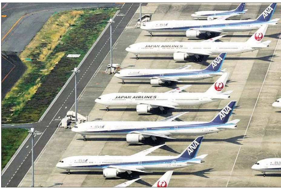
ဂျပန်နိုင်ငံ ဟာနိုဒါလေဆိပ်၌ ခရီးသည်တင်လေယာဉ်အချို့ ရပ်နားထားမှုကိုတွေ့ရစဉ်။

ကာကွယ်ရေးရရှိရေးကြိုးပမ်းမှု မအောင်မြင်ခဲ့လျှင် လေကြောင်းလိုင်းများအနေဖြင့် ကပ်ရောဂါ မကျရောက်မီက အခြေအနေသို့ ပြန်လည်ရောက်ရှိရန် မျှော်မှန်းထားမှုများ ပျက်ပြယ်သွားနိုင်ကြောင်း နိုင်ငံတကာလေကြောင်းသယ်ယူပို့ဆောင်ရေးအဖွဲ့ အကြီးအကဲက ပြောကြားခဲ့သည်။ လေကြောင်းခရီးစဉ်သွားလာမှုများသည် ပြီးခဲ့သည့် ဇွန်လအတွင်း ၈၆ ဒသမ ၅ ရာခိုင်နှုန်းကျဆင်းခဲ့ပြီး မေလတွင် ကမ္ဘာတစ်ဝန်းရှိ နိုင်ငံအများအပြားက ကိုဗစ်-၁၉ ကူးစက်ပျံ့နှံ့မှုကို ထိန်းချုပ်ရန် ခရီးသွားလာမှုဆိုင်ရာ ကန့်သတ်ချက်များချမှတ်ခဲ့ရာ ၉၁ ရာခိုင်နှုန်းအထိ ကျဆင်းသွားခဲ့သည်။ သို့ဖြစ်ရာ လေကြောင်းကုမ္ပဏီများအနေဖြင့် ၂၀၂၀ ပြည့်နှစ်တွင် အမေရိကန်ဒေါ်လာ ၈၄ ဒသမ ၃ ဘီလီယံဆုံးရှုံး ဖွယ်ရှိပြီး ဝင်ငွေရရှိမှု ၅၀ ရာခိုင်နှုန်း ကျဆင်းဖွယ်ရှိကြောင်း အဖွဲ့က ပြောကြားခဲ့သည်။