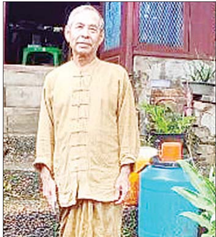
ဦးစိုးရီ၊ တနင်္သာရီမြို့

“ ၂၀၁၉ - ၂၀၂၀ ဘဏ္ဍာနှစ်ကုန်မှာတော့ ပေ ၁၈၀နဲ့ အထက်တံတား ၄၃ စင်းနဲ့ ပေ ၁၈၀ အောက်တံတား ၅၇ စင်း စုစု ပေါင်း တံတားအစင်း ၁၀၀ တည်ဆောက် ပြီးစီးမှာ ဖြစ်ပါတယ်။ တံတားတွေ တည်ဆောက်တဲ့အခါ ကျောက်၊ သဲ၊ ဘီလပ် မြေ သံချောင်းအစရှိတဲ့ တည်ဆောက်ရေး သုံးပစ္စည်းတွေ အရည်အသွေးပြည့်မီမှု ရှိ မရှိ စနစ်တကျစစ်ဆေးပြီး အသုံးပြု တည်ဆောက်လျက် ရှိပါတယ်။ လုပ်ငန်း ဆောင်ရွက်မှုအပိုင်းမှာလည်း တံတား အောက်ခြေအုတ်မြစ် လုပ်ငန်းကစပြီး အပေါ်ထည်ပိုင်းအထိ အဆင့်လိုက် အရည် အသွေး ထိန်းသိမ်းရေးလုပ်ငန်းတွေကို ကြီးကြပ်ဆောင်ရွက်လျက် ရှိပါတယ် ”