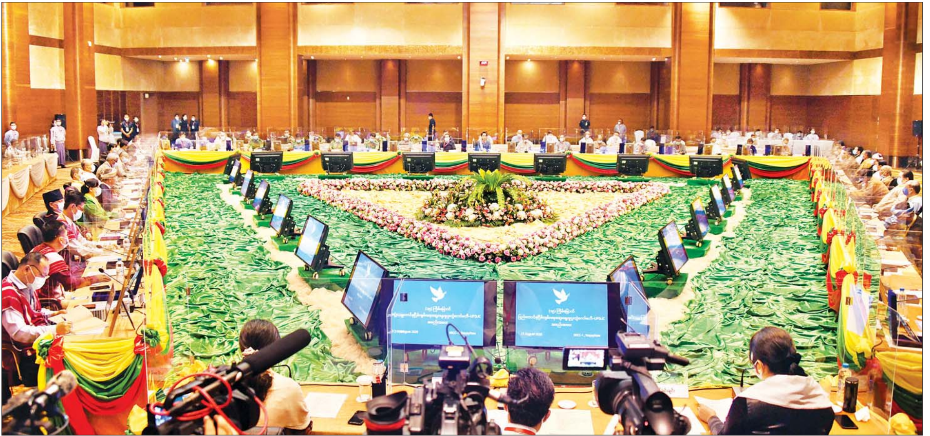
(၁၉) ကြိမ်မြောက် ပြည်ထောင်စုငြိမ်းချမ်းရေးဆွေးနွေးမှု ပူးတွဲကော်မတီ (UPDJC) အစည်းအဝေး ကျင်းပစဉ်။