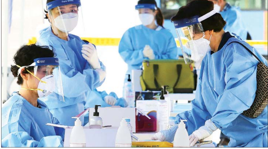
တောင်ကိုရီးယားတွင် ကိုဗစ်-၁၉ ရှိ မရှိစစ်ဆေးပေးနေသည့် ကျန်းမာရေးဝန်ထမ်းများကို တွေ့ရစဉ်။

တောင်ကိုရီးယားနိုင်ငံ၌ ကိုဗစ်-၁၉ ကူးစက်မှုနှုန်းမှာ မြင့်တက်လာခဲ့သည့်အတွက် ကူးစက်မှု ရပ်တန့်နိုင်ရေးအတွက် အစိုးရက အပြင်းအထန် ကြိုးစားလျက်ရှိပါသည်။ အထူးသဖြင့် ဆိုင်းမြို့၊ ဧရိယာတွင် ကူးစက်မှုထိန်းချုပ်နိုင်ရေး ကြိုးပမ်းနေကြပါသည်။ ဩဂုတ် ၁၆ ရက်က တောင်ကိုရီးယားတွင် ကူးစက်မှု ၂၀၀ နီးပါးကို ထပ်မံတွေ့ရှိခဲ့သည်ဟု ကျန်းမာရေး ဝန်ကြီးဌာနက ဩဂုတ် ၁၇ ရက်တွင် သတင်းထုတ်ပြန်ခဲ့ပါသည်။