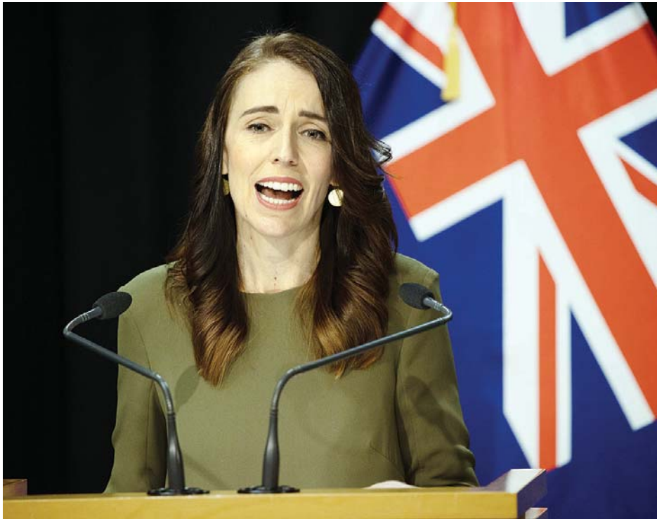
နယူးဇီလန်ဝန်ကြီးချုပ် ဂျက်ဆင်ဒါအာဒန်။