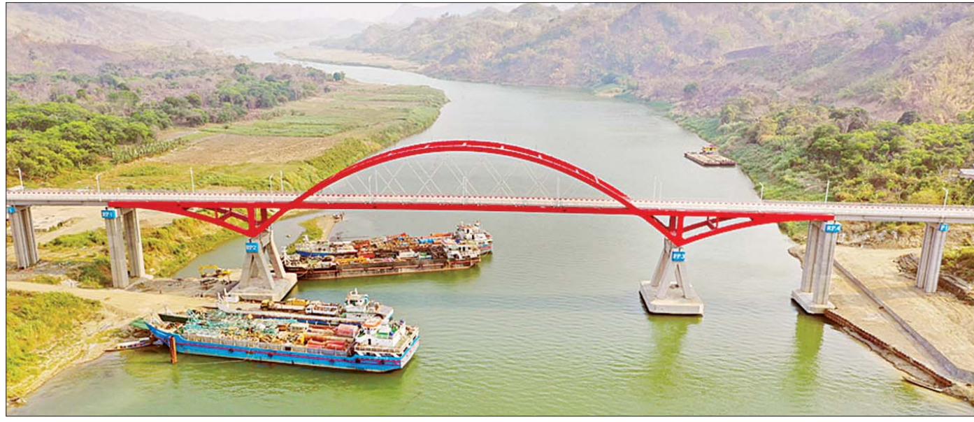
မတူပီ - ပလက်ဝလမ်းပေါ်ရှိ ပလက်ဝတံတား။

“တံတားဦးစီးဌာနအနေဖြင့် ၂၀၁၆ - ၂၀၁၇ ဘဏ္ဍာနှစ်တွင် ပေ ၁၈၀ နှင့် အထက်တံတား ၃၇ စင်း၊ ပေ ၁၈၀ အောက်တံတား ၁၁၂ စင်း၊ ၂၀၁၇ - ၂၀၁၈ ဘဏ္ဍာနှစ်တွင် ပေ ၁၈၀ နှင့် အထက်တံတား ၃၅ စင်းနှင့် ပေ ၁၈၀ အောက်တံတား ၈၉ စင်း၊ ၂၀၁၈ ခုနှစ် ဧပြီလမှ စက်တင်ဘာလအထိ မြောက်လဘတ်ဂျက်တွင် ပေ ၁၈၀ နှင့် အထက်တံတား ၁၃ စင်းနှင့် ပေ ၁၈၀ အောက်တံတား ၂၃ စင်း၊ ၂၀၁၈-၂၀၁၉ ဘဏ္ဍာနှစ်တွင် ပေ ၁၈၀ နှင့် အထက် တံတား ၃၅ စင်းနှင့် ပေ ၁၈၀ အောက်တံတား ၇၇ စင်းတို့ကို တည်ဆောက်ခဲ့”