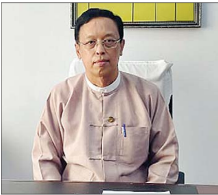
ညွှန်ကြားရေးမှူးချုပ် ဦးနေအောင်ရဲမြင့်

ဆောက်လုပ်ရေးဝန်ကြီးဌာန တံတားဦးစီးဌာန အနေဖြင့် နှစ်အလိုက် တည်ဆောက်သော တံတားအရေ အတွက် မကွာခြားသော်လည်း ယခုအစိုးရလက်ထက် တွင် Quality Management System ဖြင့် အရည်အသွေး စံချိန်စံညွှန်းများ သတ်မှတ်ကာ ထိုစံချိန်စံညွှန်းများနှင့်