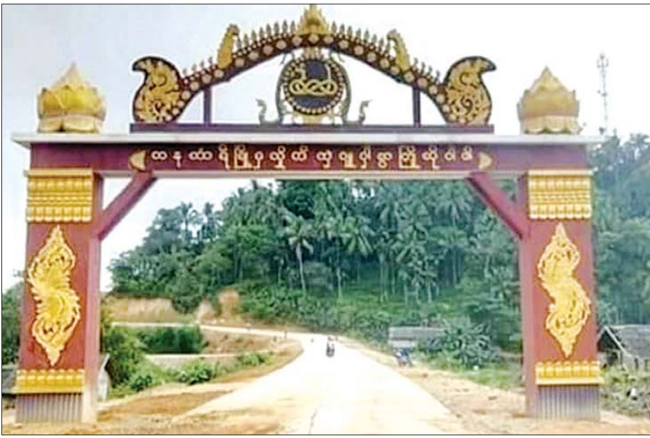
တနင်္သာရီတိုင်းဒေသကြီးမှ တနင်္သာရီမြို့

တနင်္သာရီမြို့နယ်သည် အရှေ့ဘက်တွင် ထိုင်းနိုင်ငံ၊ အနောက်ဘက်တွင် ဗြိတိသျှနယ်၊ ပုလောမြို့နယ်နှင့် ကျွန်းစုမြို့နယ်၊ တောင်ဘက်တွင် ဘုတ်ပြင်မြို့နယ်နှင့် မြောက်ဘက်တွင် ထားဝယ်မြို့နယ်နှင့် ထိစပ်နေပါသည်။ မိုင် ၂၇၀ ရှည်လျားသည့် တနင်္သာရီမြစ်သည် တနင်္သာရီမြို့နယ်အတွင်း၌ ၁၃၈ မိုင် ဖြတ်သန်းစီးဆင်းနေပြီး တနင်္သာရီမြို့၏ အရှေ့အနောက်နှင့် မြောက်ဘက်ကို