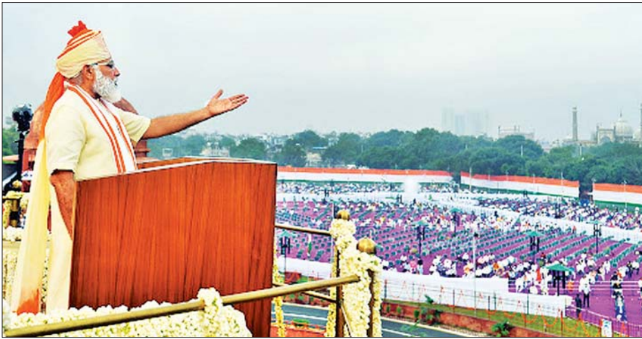
အိန္ဒိယဝန်ကြီးချုပ် နာရန်ဒရာမိုဒီ

အိန္ဒိယနိုင်ငံ၏ လွတ်လပ်ရေးနေ့ ပြည်သူများသို့ မိန့်ခွန်းပြောကြားရာ တွင် အိန္ဒိယဝန်ကြီးချုပ် နာရန် ဒရာမိုဒီက ကိုဗစ်-၁၉ ကို အနိုင်ရအောင် တိုက်ထုတ်မည်ဖြစ်ကြောင်း ပြောကြားခဲ့သည်။ အိန္ဒိယနိုင်ငံတွင် ကိုဗစ် - ၁၉ ကူးစက်ဖြစ်ပွားမှု အရှိန်မြှင့်လျက်ရှိပြီး သေဆုံးသူ အရေအတွက်မှာလည်း ပိုမိုများပြား လာလျက်ရှိသည်။ မြို့တော်နယူးဒေလီ၌ ကျင်းပခဲ့သည့် လွတ်လပ်ရေးနေ့ အခမ်းအနား တွင် မိန့်ခွန်းပြောကြားခဲ့စဉ် အတွင်း ဝန်ကြီးချုပ်မိုဒီက အိန္ဒိယနိုင်ငံတွင် ကာကွယ်ဆေးသုံးမျိုးကို တီထွင် ဖော်စပ်လျက်ရှိပြီး စမ်းသပ်မှုအဆင့် လုပ်ဆောင်လျက်ရှိကြောင်း ပြောကြားခဲ့သည်။ ကျွမ်းကျင်သူ ပညာရှင်များက မီးစိမ်းပြုလိုက်သည်နှင့် ကာကွယ်ဆေး