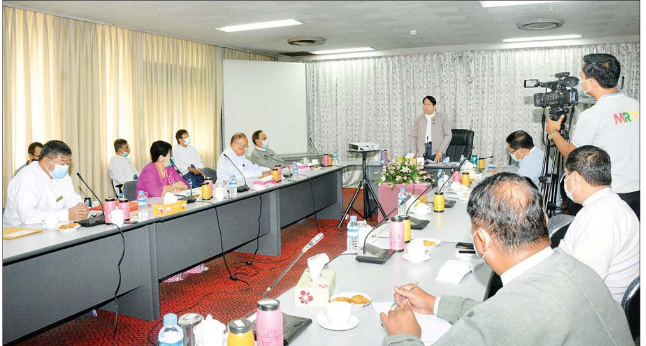
ပြည်ထောင်စုဝန်ကြီး ဒေါက်တာဖေမြင့် မြန်မာနိုင်ငံ ဂီတအစည်းအရုံး၊ မြန်မာနိုင်ငံတေးသီချင်း မူပိုင်ရှင်များအသင်းနှင့် မြန်မာနိုင်ငံတေးသီချင်း မူပိုင်ထုတ်လုပ်သူများအသင်းတို့မှ တာဝန်ရှိသူများနှင့် တွေ့ဆုံစဉ်။

မွန်လွဲပိုင်းတွင် ပြည်ထောင်စုဝန်ကြီးသည် ရန်ကုန်မြို့၊ ဗဟန်းမြို့နယ် ဝက်ပါလမ်း အမှတ် (၄) ရှိ ပြန်ကြားရေးနှင့်ပြည်သူ့ဆက်ဆံရေးဦးစီးဌာန၊