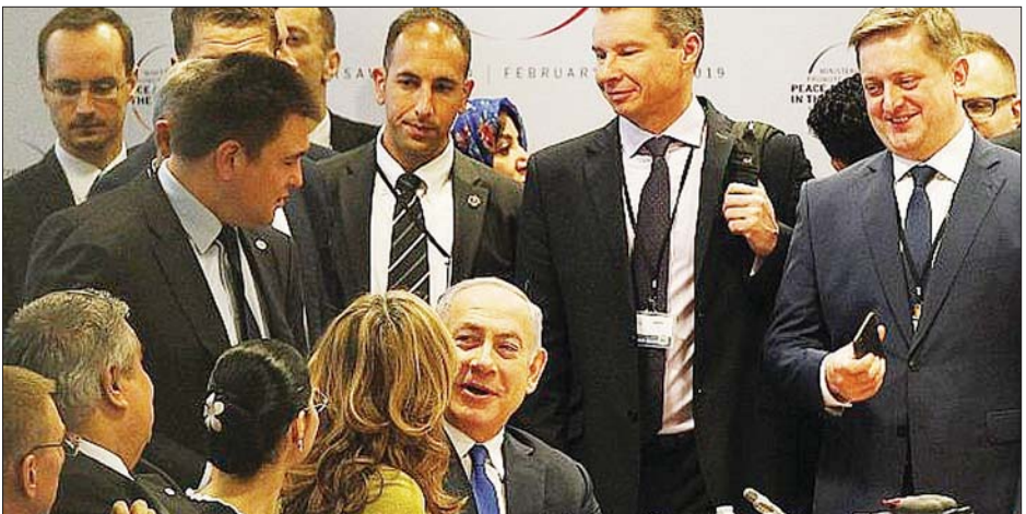
၂၀၁၉ ခုနှစ်က အရှေ့အလယ်ပိုင်းငြိမ်းချမ်းရေးနှင့် လုံခြုံရေးညီလာခံသို့ တက်ရောက်လာသည့် အစွမ်းပေးလမ်းညွှန် (အလယ်) ကို တွေ့ရစဉ်။

အစွမ်းပေးလမ်းညွှန် ဘင်ဂျမင်နေတန် ယာဟုသည် နောက်ထပ်အာရှတိုင်းများ နှင့် ငြိမ်းချမ်းရေးသဘောတူညီမှု ပြုလုပ် နိုင်ရန် အလားအလာကောင်းသည်ဟု အရိပ်အမြောက်ပြောကြားခဲ့သည်။ အာရှစော်ဘွားများ ပြည်ထောင်စု (ယူအေအီး)နှင့် ပုံမှန်ဆက်ဆံရေး ပြန်လည်ထူထောင်ရန် သဘောတူညီမှု ရပြီးနောက် အစွမ်းပေးလမ်းညွှန် ပြုလုပ် ယခုလို အရိပ်အမြောက်ပြောကြားခဲ့ခြင်း ဖြစ်သည်။