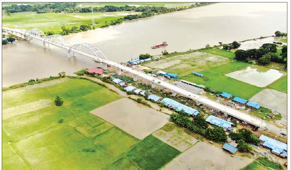
ကျောက်ဆည် - ပုလဲတိုးတိုးကျွန်းလမ်းပေါ်ရှိ ပုလဲတိုးတိုးတံတား လုပ်ငန်းဆောင်ရွက်ပြီးနောက်ပုံရိပ်