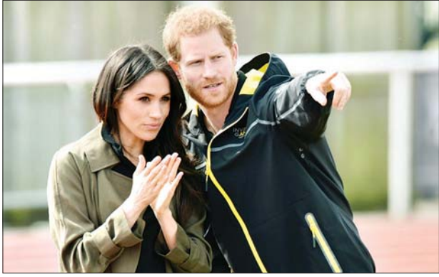
ဗြိတိန်တော်ဝင်မင်းသားဟယ်ရီနှင့် မိဂန်မာကယ်

ဗြိတိန်တော်ဝင်မင်းသား ဟယ်ရီနှင့် အမေရိကန် ရုပ်ရှင်မင်းသမီး မိဂန်မာကယ်တို့ဟာ ကယ်လီဖိုးနီးယားပြည်နယ် ဆန်တာဘာဘရာမြို့မှာ နေအိမ်ဝယ်ယူလိုက်တယ်လို့ သိရပါတယ်။ ကယ်လီဖိုးနီးယားက နေအိမ်ကို လွန်ခဲ့တဲ့လကတည်းက ပြောင်းရွှေ့ခဲ့တာလို့ ၎င်းတို့ရဲ့ ပြောရေးဆိုခွင့်ရှိသူကပြောပါတယ်။ အခုဆိုရင် ဟယ်ရီတို့စုံတွဲဟာ အခြားသောနာမည်ကြီးဖြစ်ကြတဲ့ အော်ပရာဝင်းဖရေးတို့နဲ့လည်း အိမ်နီးချင်းတွေဖြစ်သွားပါပြီ။ ဇန်နဝါရီလအတွင်းမှာဟယ်ရီနှင့် မိဂန်မာကယ်တို့ဟာ တော်ဝင်မိသားစုတာဝန်တွေကနေ နောက်ဆုတ်သွားမယ်လို့ ကြေညာခဲ့ပြီး တွဲနေက ဘဝစာမျက်နှာအသစ် စလိုက်တာပါ။ သူတို့နှစ်ဦးရရှိထားတဲ့ တော်ဝင်ဂုဏ်ထူးဘွဲ့ထူးတွေကိုလည်း စွန့်လွှတ်ခဲ့ပါတယ်။ ဘဏ္ဍာရေးအရ အမှီခိုကင်းကင်း နေချင်တယ်လို့ ဟယ်ရီတို့ ဇနီးမောင်နှံက ပြောခဲ့ပါတယ်။ မိဂန်ရဲ့ ဇာတိဖြစ်တဲ့ လော့အိန်ဂျယ်စ်မြို့ကို ပြောင်းရွှေ့တုန်းကလည်း လူသိမခံဘဲ သိုသိုသိပ်သိပ်နေထိုင်ခဲ့ကြပါတယ်။ တော်ဝင်မိသားစုရဲ့ တာဝန်တွေကိုစွန့်လွှတ်မှုအပြီး မတ်လအတွင်း ကိုဗစ် -၁၉ ကာလအတွင်း အစားအသောက်လိုအပ်နေတဲ့ မိသားစုတွေအထိတောင် အစားအသောက်ပို့ဆောင်တဲ့ အလုပ်ကိုလုပ်ခဲ့ကြပါတယ်။ မိဂန်မာကယ်ဟာလည်း ဟောလိဝုဒ်လောကထဲကို ပြန်လည်ခြေချဖို့ ကြိုးပမ်းမှုတစ်ရပ်အနေနဲ့ ဒစ္စနေးနဲ့ ပူးပေါင်းရိုက်ကူးတဲ့ မှတ်တမ်းရုပ်ရှင်မှာ အသံနဲ့ပါဝင်ထားပါတယ်။