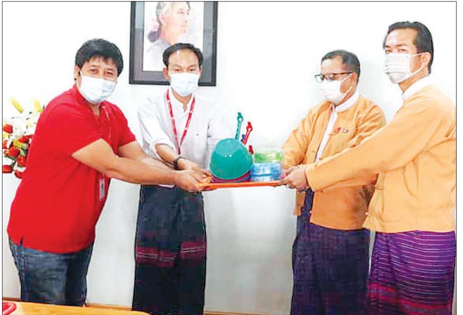
ကယားပြည်နယ်ဝန်ကြီးချုပ် ဦးအယ်လ်ဖောင်းရှိ ကိုဗစ်- ၁၉ ကာကွယ်ရေးလုပ်ငန်းသုံးပစ္စည်းများကို လက်ခံစဉ်။