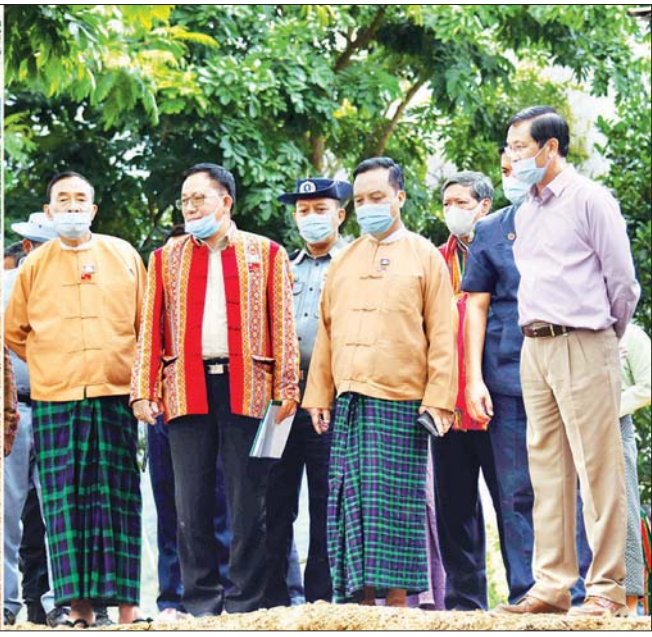
ဒုတိယသမ္မတ ဦးဟင်နရီဗန်ထီးယူ ထန်တလန်မြို့ ရေပေးဝေရေး ရေလှောင်ကန်တည်ဆောက်နေမှုကို ကြည့်ရှုစစ်ဆေးစဉ်။