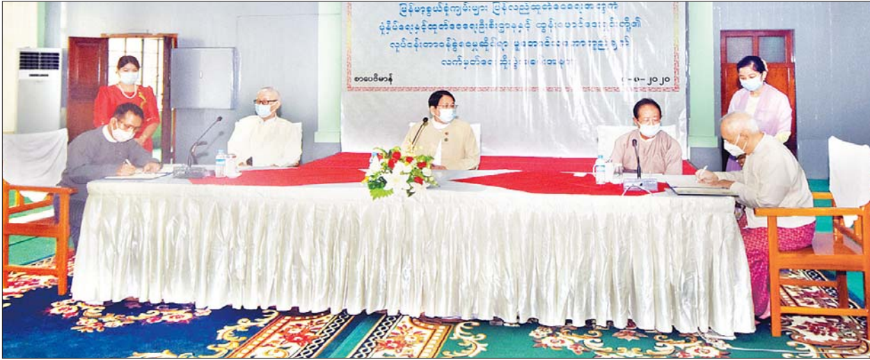
ရန်ကုန် ဩဂုတ် ၁၄

မြန်မာ့စွယ်စုံကျမ်းများ ပြန်လည်ထုတ်ဝေရေးအတွက် ပုံနှိပ်ရေးနှင့် ထုတ်ဝေရေးဦးစီးဌာန စာပေဗိမာန်နှင့် ထွန်းဖောင်ဒေးရှင်းတို့၏ လုပ်ငန်းတာဝန်ခွဲဝေမှုဆိုင်ရာ မူဘောင်သဘောတူညီချက် လက်မှတ်ရေးထိုးပွဲအခမ်းအနားကို ယနေ့ညနေပိုင်းက ရန်ကုန်မြို့ ကျောက်တံတားမြို့နယ် ကုန်သည်လမ်း အမှတ် (၅၂၉/၅၃၁) ရှိ စာပေဗိမာန်၌ ကျင်းပရာ ပြန်ကြားရေးဝန်ကြီးဌာန ပြည်ထောင်စုဝန်ကြီးဒေါက်တာဖေမြင့် တက်ရောက်သည်။