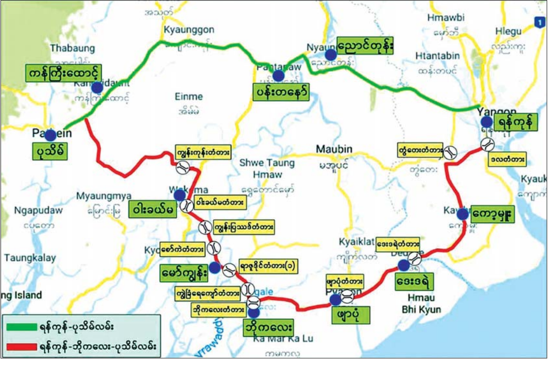
ရန်ကုန်- ဘိုကလေး- ပုသိမ်လမ်း (ရန်ကုန်- ကော့မှူး- ဖျာပုံ-ဘိုကလေး- မော်လမြိုင်ကျွန်း- ဝါးခယ်မ- ပုသိမ်လမ်း)