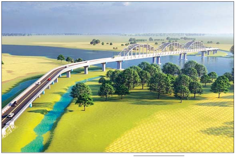
တံတားတည်ဆောက်ပြီးစီးပါက ဖြစ်ပေါ်လာမည့် စော်ကဲတံတား