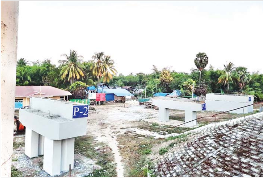
ဝါးခယ်မဘက်ကမ်း လုပ်ငန်းဆောင်ရွက်ထားမှု အခြေအနေ တွေ့ရစဉ်။