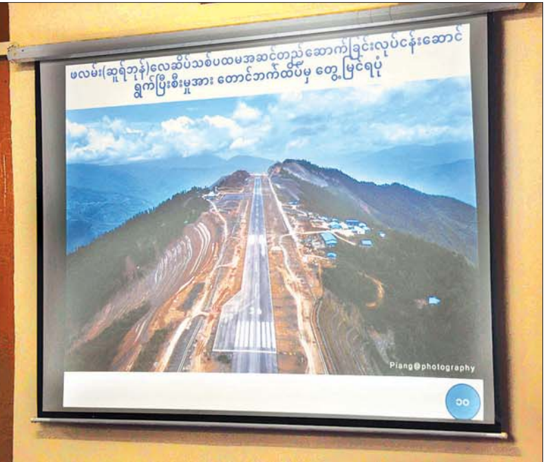
ဒုတိယသမ္မတ ဦးဟင်နရီဗန်ထီးယူ အား ဖလမ်း(ဆူရ်ဘုန်) လေယာဉ်ကွင်းတည်ဆောက်ပြီးစီးမှုကို တာဝန်ရှိသူတစ်ဦးက ရှင်းလင်းတင်ပြစဉ်။