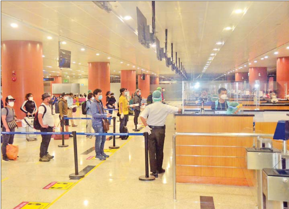
အိန္ဒိယနိုင်ငံမှ ပြန်လည်ရောက်ရှိလာသည့် မြန်မာနိုင်ငံသားများအား ရန်ကုန်အပြည်ပြည်ဆိုင်ရာလေဆိပ်၌ တွေ့ရစဉ်။

နေပြည်တော် ဩဂုတ် ၁၄ နိုင်ငံတကာခရီးသည်တင်လေယာဉ်များပျံသန်းမှု ယာယီရပ်ဆိုင်းထားခြင်းကြောင့် အိန္ဒိယနိုင်ငံ၌ အခက်အခဲကြုံတွေ့နေရသည့် မြန်မာနိုင်ငံသား ၁၂၂ ဦးအား မြန်မာအမျိုးသားလေကြောင်းလိုင်း (MNA) ကယ်ဆယ်ရေးလေယာဉ်ဖြင့် ပြန်လည်ခေါ်ဆောင်ခဲ့ရာ ယနေ့ ညနေပိုင်းတွင် ရန်ကုန်အပြည်ပြည်ဆိုင်ရာ လေဆိပ်သို့ အဆင်ပြေချောမွေ့စွာ ပြန်လည်ရောက်ရှိကြသည်။ ၎င်းတို့ ရန်ကုန်အပြည်ပြည်ဆိုင်ရာလေဆိပ်သို့ ရောက်ရှိချိန်တွင် လူဝင်မှုကြီးကြပ်ရေး၊ ကျန်းမာရေးစိစစ်ရေးနှင့် ၂၁ ရက်တာ အသွားအလာ ကန့်သတ်ရေးထိုင်ရေးတို့ကို အလုပ်သမား၊ လူဝင်မှုကြီးကြပ်ရေးနှင့် ပြည်သူ့အင်အားဝန်ကြီးဌာန၊ ကျန်းမာရေးနှင့်အားကစားဝန်ကြီးဌာန စာမျက်နှာ ၁၆ ကော်လံ ၁ ၀