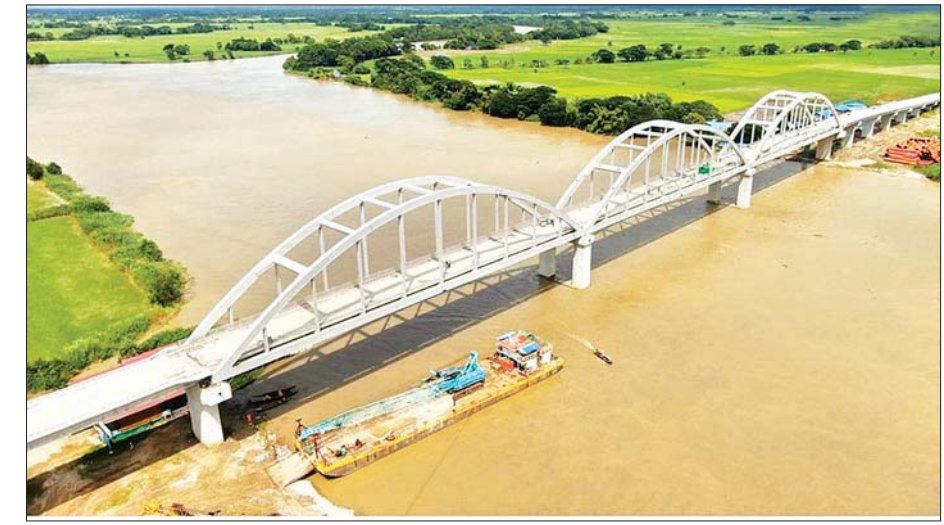
စော်ကဲတံတားလုပ်ငန်းတည်ဆောက်နေမှုကို တွေ့မြင်ရစဉ်။

သံမဏိ သံပေါင်တံတားအဖြစ် တံတားတည်ဆောက်ရေး အဖွဲ့ (၁၅) က တာဝန်ယူ တည်ဆောက်ပေးလျက်ရှိကြောင်း သိရှိရပါသည်။ အဆိုပါ တံတားကြီးများ ပြီးစီးသွားပါက ဘိုကလေးမြို့၊ မော်လမြိုင်ကျွန်းမြို့၊ ဝါးခယ်မမြို့တို့မှ ပုသိမ်မြို့သို့ အချိန်တိုတိုဖြင့် သွားရောက်နိုင်ကြမည်အပြင် ဖျာပုံ၊ ဒေးဒရဲမြို့တို့မှ ခရီးသွားပြည်သူများအနေဖြင့် မအူပင်-ပန်းတနော်- ပုသိမ်အဝေးပြေးလမ်းမကြီးမှ ပုသိမ်မြို့သို့ သွားရမည့်ခရီးလမ်းထက် အချိန်သက်သာစွာဖြင့် သွားလာနိုင်တော့မည်ဖြစ်ကြောင်း သိရှိရပါသည်။