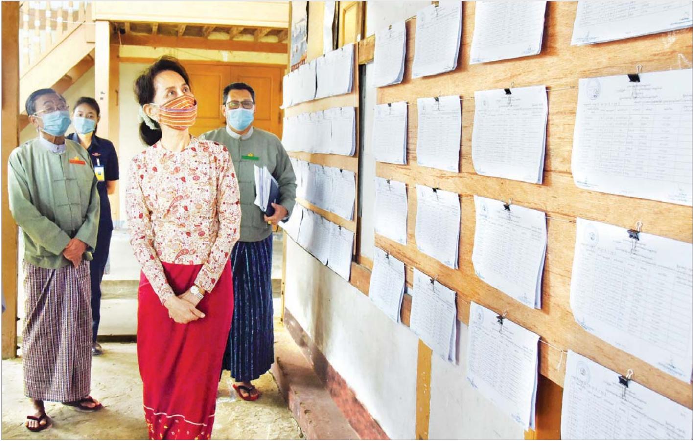
နိုင်ငံတော်၏အတိုင်ပင်ခံပုဂ္ဂိုလ် ဒေါ်အောင်ဆန်းစုကြည် ဒက္ခိဏသီရိမြို့နယ် ရန်အောင်မြင်ကျေးရွာအုပ်စု အုပ်ချုပ်ရေးမှူးရုံး၌ မဲပေးခွင့်ရှိသူများစာရင်း ကပ်ထားကြေညာထားရှိမှုကို ကြည့်ရှုစဉ်။

ထိုသို့လှည့်လည်ကြည့်ရှုစဉ် နိုင်ငံတော်၏အတိုင်ပင်ခံပုဂ္ဂိုလ်က မဲရုံနှင့် မဲပေးနိုင်သည့်အခါ အချိန်အတိုင်း အတာဖြင့် မဲပေးနိုင်မည့် အရေအတွက်၊ မဲဆန္ဒရှင်များ မဲပေးရာတွင် ပိုမိုကောင်းမွန် မြန်ဆန်ရေးအတွက် ဆောင်ရွက်သွားမည့် အစီအစဉ်တို့နှင့် စပ်လျဉ်း၍ သိလိုသည်များကို တာဝန်ရှိသူများအား မေးမြန်းကာ မဲစာရင်း ကပ်ထားကြေညာမှုကို ပြည်သူများအား အသိပေးကြေညာသွားရန်လိုကြောင်း မှာကြားပြီး ရပ်ကွက်အုပ်ချုပ်ရေးမှူးရုံးများနှင့် ဓမ္မာရုံများ၌ ရောက်ရှိနေကြသည့် ပြည်သူများအား လက်ရှိ အသက်(၁၈)နှစ်အရွယ် မဲပေးနိုင်သည့် ပုဂ္ဂိုလ်မှာ အသက်(၈၀) အရွယ်အထိဆိုလျှင် (၁၂)ကြိမ်သာ မဲပေးနိုင်ခွင့်ရှိကြောင်း၊ ပြည်သူများအနေဖြင့် မိမိနှစ်သက်အရာကို မဲပေးရန်လိုကြောင်း၊ ပြည်သူများအနေဖြင့် မိမိတာဝန်ကို ကျေပွန်ရန်လိုကြောင်း၊ သို့မှသာ ရသင့်ရထိုက်သည့် ခံစားခွင့်များ ရရှိမည်ဖြစ်ကြောင်း၊ တာဝန်ရှိသူများအနေဖြင့်လည်း မဲဆန္ဒရှင်များကို ကျန်းမာရေးနှင့်အညီ မဲပေးနိုင်ရန် ဆောင်ရွက်လျက် ရှိပါကြောင်း၊ ပြည်သူများအနေဖြင့်လည်း မဲစာရင်းတွင်