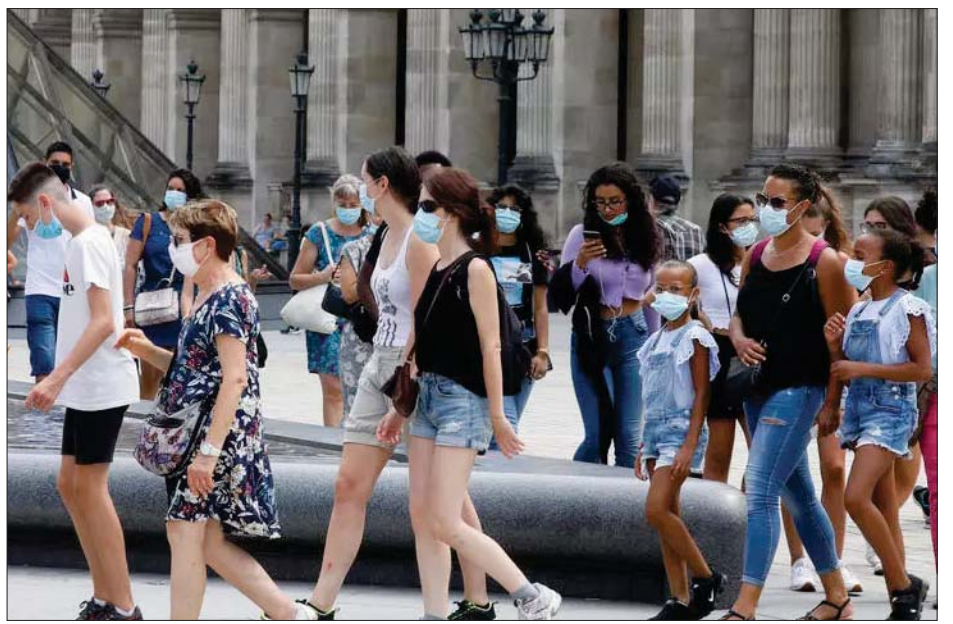
ပါရီရှိ ခရီးသွားများ ပါးစပ်နာခေါင်းစည်းတပ်ဆင်ထားပြီး သွားလာနေသည်ကို တွေ့ရစဉ်။

ကြောင်း သိရသည်။ ကိုဗစ် - ၁၉ အသစ် ထပ်မံကူးစက်မှုများအနက် ၅၀ မှာ ပြင်သစ်နိုင်ငံအနောက်တောင်ပိုင်း တာဘတ်စ်ရှိ ရဲများဖြစ်ကြောင်းနှင့် ၎င်းတို့သည် ကျွန်းစုနိုင်ငံများမှ ပြန်လာသူများဖြစ်ကြောင်း သိရသည်။ ကူးစက်ရောဂါထိန်းချုပ်မှုအပေါ် လျော့ရိလျော့ရဲ ဖြစ်လာသည်နှင့် ကိုဗစ် - ၁၉ ကူးစက်မှုနှုန်းများ တိုးလာနိုင်ကြောင်း ကမ္ဘာ့ကျန်းမာရေးအဖွဲ့ ဥရောပ ဌာနမှ ကူးစက်ရောဂါပြန့်ပွားခြင်းနှင့် ကာကွယ်ခြင်း ဆိုင်ရာ ပညာရှင် ရစ်ချက်ဒ်ဘော့ဒီက ပြောကြားလိုက် သည်။ ကိုဗစ် - ၁၉ ကို ပေါ့ပေါ့ဆဆသဘောထားလျှင် ၎င်းကပြန်လာဦးမည်ဖြစ်ကြောင်း၊ ပြီးခဲ့သောလ ဖြစ်စဉ် များမှ သင်ခန်းစာများကိုယူသင့်ကြောင်း ၎င်းက အစိုးရကို တိုက်တွန်းပြောကြားထားသည်။ ယခုအချိန်အထိ ပြင်သစ်နိုင်ငံတွင် ကိုဗစ် - ၁၉ ကြောင့် လူပေါင်း ၃၀၄၀၀ နီးပါးသေဆုံးခဲ့ပြီး ၃၄၇ ဦးကို အထူး ကြပ်မတ်ကုသပေးလျက်ရှိကြောင်း သိရသည်။ အေအက်ပီ