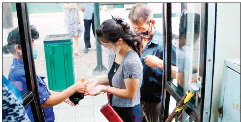
ဖြူယမ်းမြို့တွင် ကိုဗစ် - ၁၉ ကာကွယ်ရေးလုပ်ငန်းများ လုပ်ဆောင်နေသည်ကို တွေ့ရစဉ်။