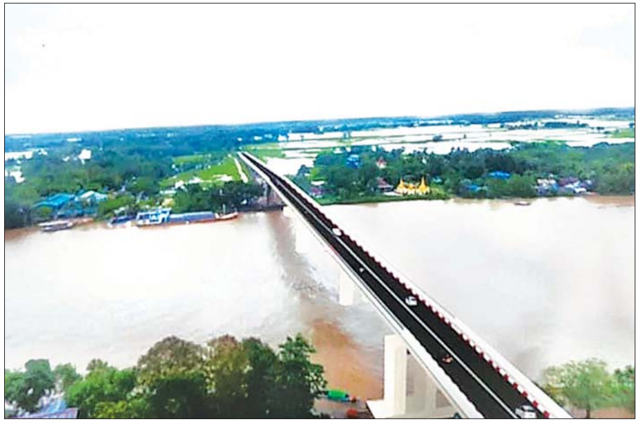
ဝါးခယ်မတံတားတည်ဆောက်ပြီးစီးပါက တွေ့မြင်ရမည့်ပုံစံ။