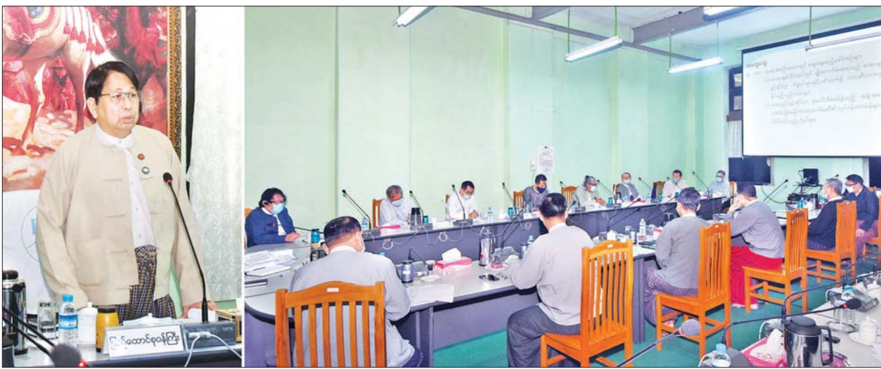
ပြည်ထောင်စုဝန်ကြီး ဒေါက်တာဖေမြင့် စာပေမူပိုင်ခွင့်ဆိုင်ရာ စုပေါင်းစီမံခန့်ခွဲသည့် အဖွဲ့အစည်းဖြစ်မြောက်ရေးကော်မတီဖွဲ့စည်းရေးဆိုင်ရာ အစည်းအဝေး တွင် အမှာစကားပြောကြားစဉ်။

ရှေးဦးစွာ ပြည်ထောင်စုဝန်ကြီး က စာပေမူပိုင်ခွင့်ဆိုင်ရာ အစည်း အဝေးတစ်ရပ်ကို ယခုလဆန်းပိုင်းက ပြုလုပ်ခဲ့ပြီး စာပေမူပိုင်ခွင့်ချိုးဖောက် မှုများကို ပိုင်းဝန်းဆွေးနွေးခဲ့ကြ ပါကြောင်း၊ စာပေမူပိုင်ခွင့် ချိုးဖောက် ခံရမှုများမှာ ယခင်ကတည်းက ရှိခဲ့သော်လည်း ကြီးကြီးကျယ်ကျယ် မဖြစ်အောင် စာပေပညာရှင်များက ထိန်းသိမ်း ဆောင်ရွက်ခဲ့ကြပါ ကြောင်း၊ ယခုအခါ အွန်လိုင်းပေါ်တွင် စာပေမူပိုင်ခွင့် ချိုးဖောက်မှုများ ပိုမိုများပြားလာပြီး ယခင်ကထက် ရှုပ်ထွေးလာသော်လည်း စာပေမူပိုင် ခွင့် ချိုးဖောက်ခံရသူများအနေဖြင့် မည်သို့ ဖြေရှင်းရမည်ကိုမသိရှိခြင်း၊ အမှုမဲ့အမှတ်မဲ့ရှိနေခြင်း၊ မူပိုင်ခွင့် ကာကွယ်ရန်လိုအပ်ခြင်း၊ ပြဿနာ ဖြစ်ပွားမှုများကို ညှိနှိုင်းဖြေရှင်း ပေးရန် လိုအပ်ခြင်းများ ရှိနေပါ ကြောင်း၊ စာပေနှင့် အနုပညာမူပိုင်ခွင့် ဥပဒေ အတည်ပြုပြဋ္ဌာန်းရန်၊ နည်းဥပဒေ ရေးဆွဲပြဋ္ဌာန်းရန် ဆောင်ရွက်နေစဉ် စာပေနှင့် အနု ပညာ မူပိုင်ခွင့် (သို့မဟုတ်) ဆက်နွယ် သည့် အခွင့်အရေးဆိုင်ရာ စုပေါင်း စီမံခန့်ခွဲသည့် အဖွဲ့အစည်း(Collative Management Organization-CMOs) များ မပေါ်ပေါက်သေးမီ ကာလအတွင်း ပေါ်ပေါက်လာသည့် ပြဿနာရပ်များကို ပူးပေါင်းကူညီ ဖြေရှင်းပေးရန်နှင့် ထိန်းသိမ်း တည်မတ် ပြုပြင်ပေးရန် လိုအပ် ပါကြောင်း၊ ထို့ကြောင့် ယခင်အစည်း အဝေးက ဆွေးနွေးခဲ့သည့်အတိုင်း စာပေမူပိုင်ခွင့်ဆိုင်ရာ စုပေါင်း စီမံခန့်ခွဲသည့် အဖွဲ့အစည်းဖြစ်မြောက်