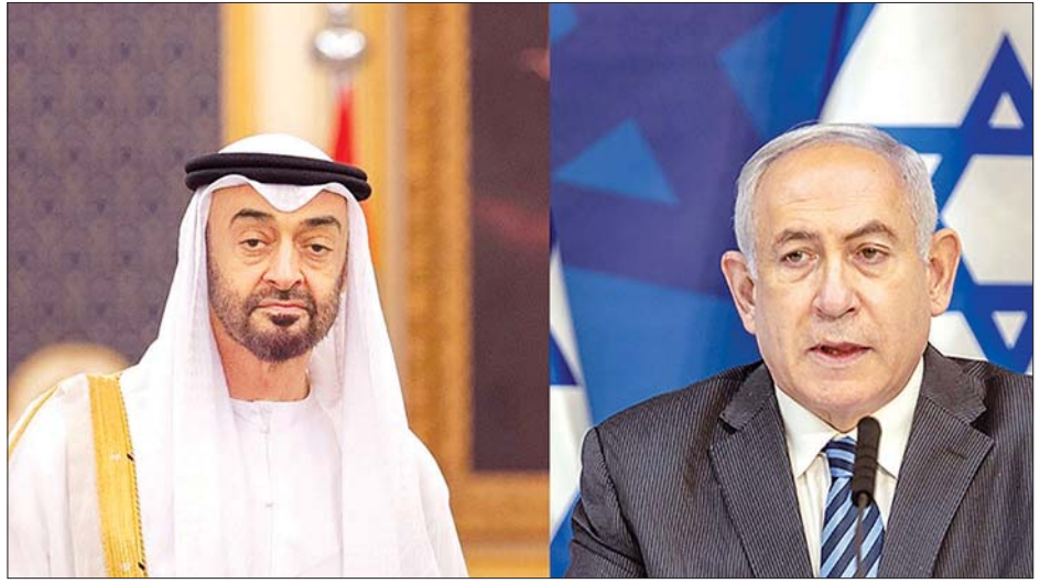
အဘူဒါဘီ၏ အိမ်ရှေ့မင်းသား မိုဟာမက် ဘင် စာယက် အယ်လ်နာရန်နှင့် အစ္စရေးဝန်ကြီးချုပ် ဘင်ဂျမင်နေတန်ယာဟု