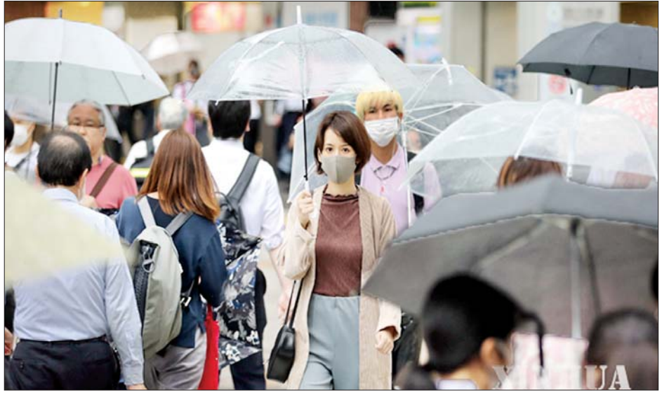
ဂျပန်နိုင်ငံ၌ ကိုဗစ်-၁၉ ဖြစ်ပွားနေစဉ် နာခေါင်းစည်း တပ်ဆင်၍ သွားလာနေသည်ကိုတွေ့ရစဉ်။

တိုးမြှင့်ခဲ့ပြီး စုစုပေါင်းသေဆုံးသူ ၁၀၇၃ ဦးအထိ ရောက်ရှိခဲ့သည်။ ဂျပန်နိုင်ငံကျန်းမာရေးအလုပ်သမားနှင့် လူမှုဖူလုံရေး ဝန်ကြီးဌာန၏ ထုတ်ပြန်ကြေညာချက်အရ ဂျပန်နိုင်ငံတွင် လူပေါင်း ၃၆၁၃၄ ဦး ရောဂါပြန်လည်သက်သာလာခဲ့သော ကြောင့် သီးသန့်ခွဲခြားနေထိုင်မှုကို ပယ်ဖျက်ပေးခဲ့ကြောင်း သိရသည်။ လူပေါင်း ၁ ဒသမ ၀၈၅ သန်းအား ကိုဗစ်-၁၉ ရောဂါ စစ်ဆေးမှုပြုလုပ်ပေးခဲ့ပြီး တစ်နေ့လျှင် လူပေါင်း ၂၇၀၀၀ ကျော် တိုးမြှင့်စစ်ဆေးပေးခဲ့ကြောင်း သိရသည်။ အိုကီနာဝါခရိုင်၏ ထုတ်ပြန်ချက်အရ ဩဂုတ် ၁၃ ရက် ၁၂ နာရီအထိ အိုကီနာဝါရှိ အမေရိကန်စစ်အခြေစိုက် စခန်းတွင် ကိုဗစ်-၁၉ ရောဂါကူးစက်ခဲ့ရသူ သုံးဦးတိုးခဲ့ပြီး စုစုပေါင်းကူးစက်ခဲ့ရသူ ၃၂၃ ဦး ရှိလာခဲ့ကာ လူပေါင်း ၂၅၅ ဦးကို သီးသန့်ခွဲခြားနေထိုင်မှုမှ ပယ်ဖျက်ပေးခဲ့ကြောင်း သိရသည်။ ဆင်ဟွာ