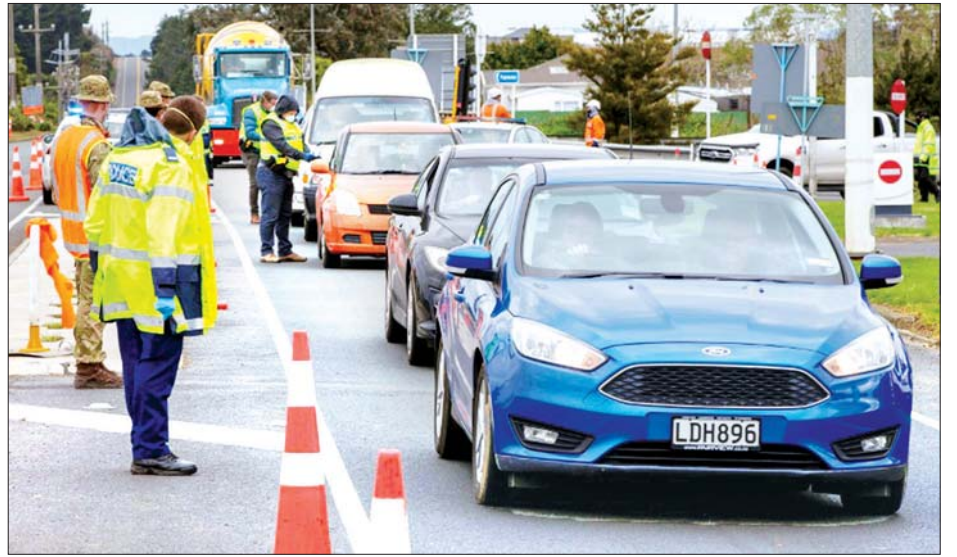
အော့ကလန်မြို့မှ ထွက်ခွာလာသည့်ကားများကို ရဲများ စစ်ဆေးနေကြစဉ်။