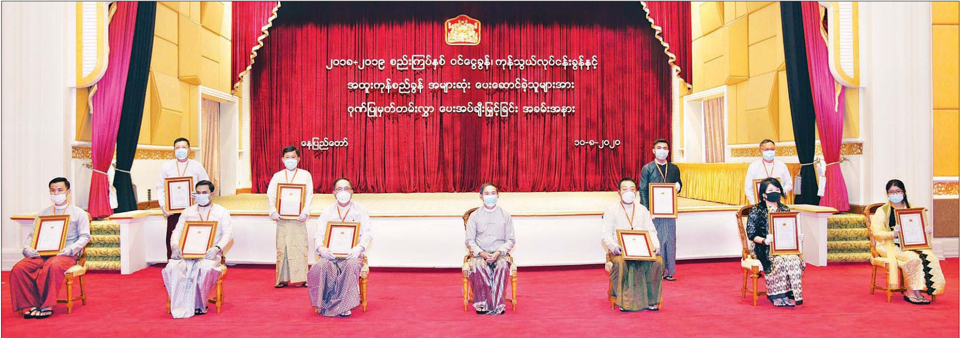
နိုင်ငံတော်သမ္မတ ဦးဝင်းမြင့် ၂၀၁၈-၂၀၁၉ စည်းကြပ်နှစ်အတွက် ကုန်သွယ်လုပ်ငန်းခွန် အများဆုံးပေးဆောင်ခဲ့ကြသော မြန်မာကုမ္ပဏီများမှ လုပ်ငန်းရှင်များနှင့်အတူ စုပေါင်းမှတ်တမ်းတင် ဓာတ်ပုံရိုက်စဉ်။