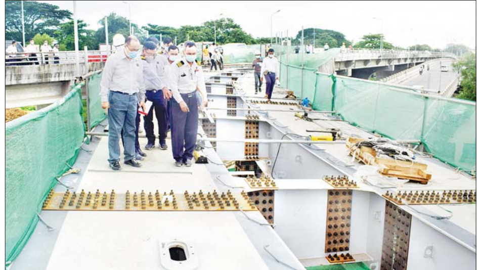
ပြည်ထောင်စုဝန်ကြီး ဦးသန့်စင်မောင် ရန်ကုန်တိုင်းဒေသကြီး အင်းစိန်ရထားလမ်း ခုံးကျော်တံတားသစ် (မင်းကြီးလမ်း) ဘက်ခြမ်း ချဉ်းကပ်တံတားနှင့် လမ်းသစ်လမ်းဘက်ခြမ်းတံတားများ တိုးချဲ့တည်ဆောက်နေမှု ကြည့်ရှုစစ်ဆေးစဉ်။

ယင်းနောက် ဟင်္သာတဘူတာ တွင် ဝန်ထမ်းများနှင့် တွေ့ဆုံပြီး ဝန်ထမ်းတိုင်းသည် မိမိတို့၏ လုပ်ငန်းတာဝန်များကို အောင်မြင် အောင် ဆောင်ရွက်ရာတွင် ရေသာ မခိုသူ၊ ရိုးသားသူ၊ စည်းကမ်းရှိသူ၊ ဥပဒေကို လေးစားလိုက်နာသူများ ဖြစ်ရန် အထူးလိုအပ်ပါကြောင်း၊ မိမိ ဌာန ဖွံ့ဖြိုးတိုးတက်ရန်အတွက် ဝန်ထမ်းတိုင်းတွင် တာဝန်ရှိပါကြောင်း၊ ရထား ဝန်ထမ်းများအနေဖြင့် မြေယာလျော်ကြေး ပေးအပ်ပြီးသော