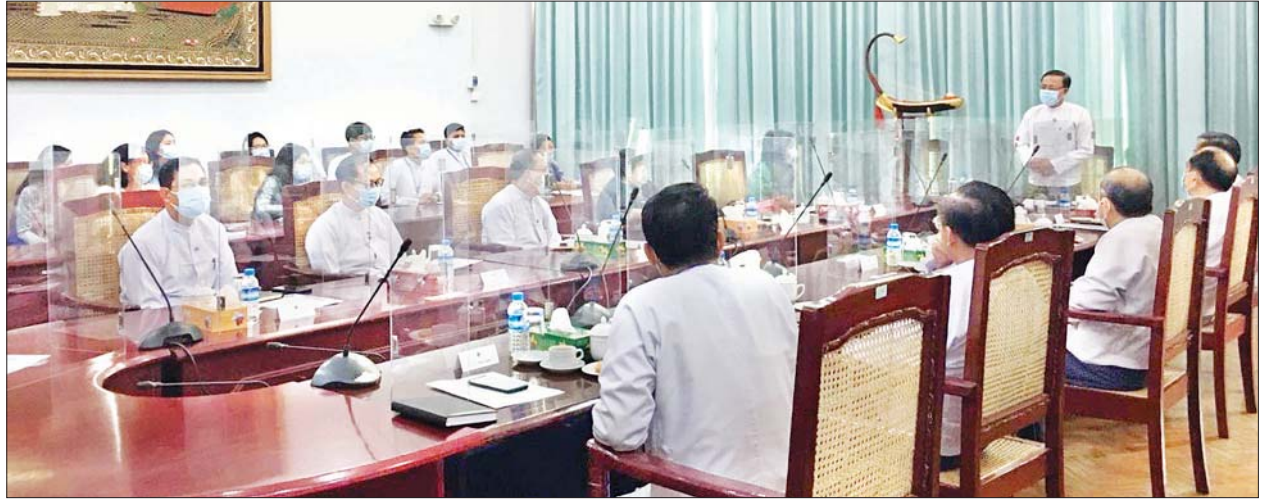
စကားပြန်ခြင်းနည်းစနစ်များ၊ Note Taking နည်းစနစ်များ၊ Public Speaking သင်ကြားပို့ချသွားမည်ဖြစ်ကြောင်း သိရသည်။ ဆိုင်ရာ သိမှတ်ဖွယ်ရာများကို တစ်နေ့လျှင် သုံးနာရီနှုန်းဖြင့် စာတွေ့လက်တွေ့

အဆိုပါသင်တန်းကို နိုင်ငံခြားရေးဝန်ကြီးဌာနအနေဖြင့် ကိုဗစ်-၁၉ ကာကွယ်ရေးဆိုင်ရာ လမ်းညွှန်ချက်များ၊ စည်းမျဉ်းစည်းကမ်းများနှင့်အညီ ဖွင့်လှစ်သွားမည်ဖြစ်ပြီး သင်တန်းသို့ နိုင်ငံခြားရေးဝန်ကြီးဌာနမှ စကားပြန်အဖြစ် ဆောင်ရွက်လျက်ရှိသူများအပါအဝင် ဌာနစုမှူး-၂ မှ လက်ထောက်ညွှန်ကြားရေးမှူးအဆင့်အထိ အရာထမ်း စုစုပေါင်း ၁၀ ဦး တက်ရောက်မည် ဖြစ်သည်။ သင်တန်းတွင် စကားပြန်ဘာသာရပ်နှင့်စပ်လျဉ်း၍ သိသင့်သလိုက်သည့်