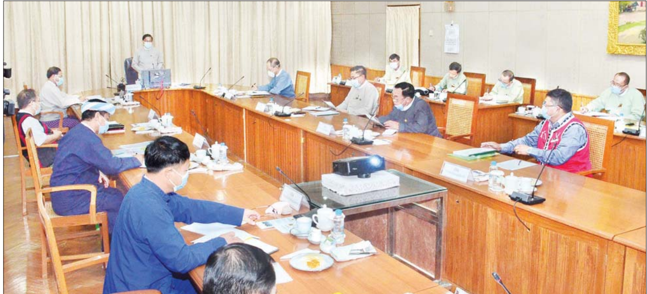
ပြည်ထောင်စုဝန်ကြီး ဦးမင်းသူ ကိုယ်ပိုင်အုပ်ချုပ်ခွင့်ရတိုင်းနှင့် ဒေသဦးစီးအဖွဲ့ ဥက္ကဋ္ဌများနှင့် အုပ်ချုပ်ရေးဆိုင်ရာကိစ္စရပ်များ ရှင်းလင်းဆွေးနွေးပွဲ။ သတင်းစဉ်

ပြည်ထောင်စုအစိုးရအဖွဲ့ရုံးဝန်ကြီးဌာန ပြည်ထောင်စုဝန်ကြီး ဦးမင်းသူသည် ယနေ့ နံနက် ၉ နာရီတွင် နေပြည်တော်ရှိ နိုင်ငံတော်သမ္မတရုံး အစည်းအဝေးခန်းမ၌ ကျင်းပပြုလုပ်သည့် ကိုယ်ပိုင်အုပ်ချုပ်ခွင့်ရတိုင်းနှင့် ဒေသဦးစီးအဖွဲ့ ဥက္ကဋ္ဌများနှင့် အုပ်ချုပ်ရေးဆိုင်ရာကိစ္စရပ်များ ရှင်းလင်းဆွေးနွေးပွဲ အခမ်းအနားသို့ တက်ရောက်သည်။