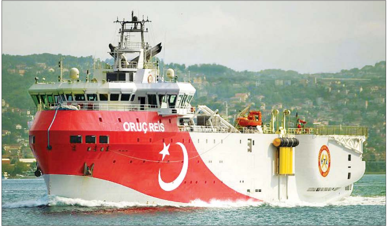
တူရကီနိုင်ငံက မြေထဲပင်လယ်အရှေ့ပိုင်းသို့ စေလွှတ်လိုက်သည့် Oruc Reis သုတေသနသင်္ဘောကို တွေ့ရစဉ်။