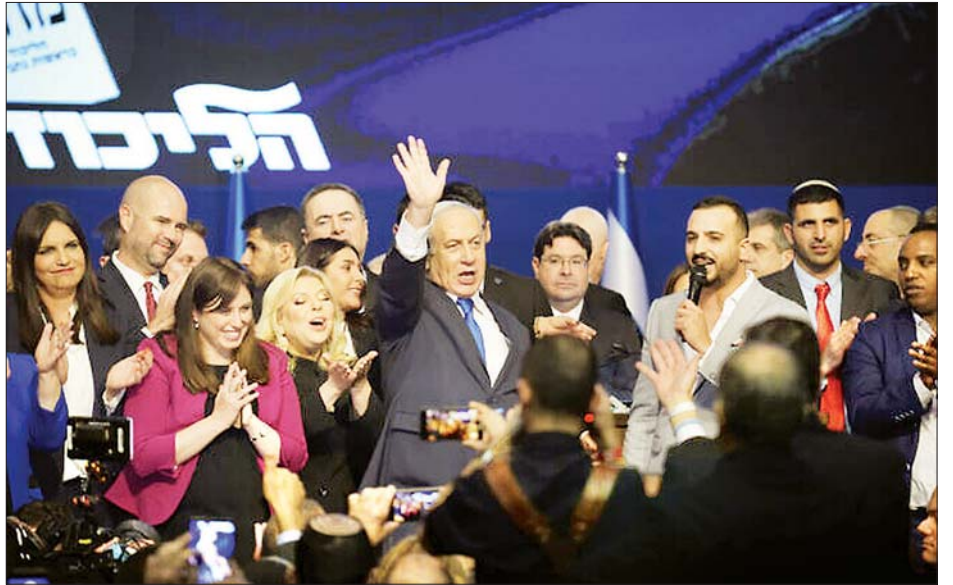
ရွေးကောက်ပွဲအပြီးတွင် အစွဲရေးဝန်ကြီးချုပ် နေတန်ယာဟုကို လီကွတ်ပါတီမှ အမတ်များနှင့်အတူ တွေ့ရစဉ်။

မတ်လအတွင်းက ကျင်းပခဲ့သည့် ရွေးကောက်ပွဲအတွင်း မည်သည့်ပါတီကမူ အစိုးရဖွဲ့နိုင်လောက်သည်အထိ မဲအရေအတွက် မရရှိခဲ့ပေ။ နိုင်ငံရေးအရ ရှေ့မတိုးသာ နောက်မဆုတ်သာ အခြေအနေကိုရှောင်ရှားရန် အစိုးရအဖွဲ့အတွင်း အာဏာခွဲဝေမှုအစီအစဉ်ကို ပြုလုပ်ခဲ့သည်။ အာဏာခွဲဝေရေးစာချုပ်အရ နေတန်ယာဟုနှင့် ဘန်နီဂန်နီတို့သည် ၁၈ လစီ အလှည့်ကျဝန်ကြီးချုပ်အဖြစ် တာဝန်ထမ်းဆောင်သွားရန် မျှော်လင့်ထားကြသည်။ ဆင်ဟွာ