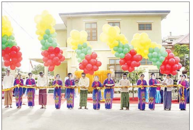
အတွက် ချမ်းမြသာစည်မြို့နယ် ၁၀၄ လမ်း၊ ၆၅ လမ်းနှင့် ၆၆ လမ်းကြားတွင် အလှူပေးပေ ၃၀၊ အန် ပေ ၅၀ ရှိ အာစီနစ်ထပ် အဆောက်အအုံသစ်ကို ပြောင်းရွှေ့ ဖွင့်လှစ်ခဲ့ခြင်းဖြစ်ကြောင်း သိရသည်။

ချမ်းမြသာစည်မြို့နယ် အခွန်ဦးစီးဌာနမှူးရုံးကို ယခင်က ၇၃ လမ်း မနေဟရီလမ်းနှင့် နိုင်ရွှေဝါလမ်းတွင် ဖွင့်လှစ်ထားရှိရာမှ မြို့ပြစီမံကိန်း တိုးချဲ့အကောင်အထည်ဖော်ရာတွင် လမ်းဧရိယာနှင့် လွတ်ကင်းမှုမရှိသည့်