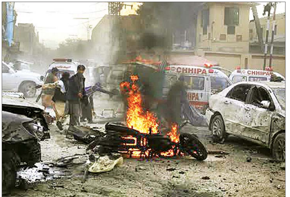
ပေါက်ကွဲမှု မြင်ကွင်းကို တွေ့ရစဉ်။

ပြည်ထဲရေးဝန်ကြီး အီဂျက်ရှားက ပြောသည်။ မကျေနပ်မှုများပေါ်ပေါက် တွင်းထွက်ပစ္စည်း ကြွယ်ဝသည့် ဘလူချီစတန်ပြည်နယ်သည် အာဖဂန်နစ္စတန်၊ အီရန်နှင့် နယ်နိမိတ်ချင်း ထိစပ်လျက်ရှိပြီး ပါကစ္စတန်ရှိ အကြီးဆုံးပြည်နယ်လေးခုထဲမှ တစ်ခုဖြစ်သည်။ ယင်းပြည်နယ်တွင် နေထိုင်ကြသူများမှာ ဓာတ်ငွေ့နှင့် သဘာဝသယံဇာတများကို မျှဝေခံစားရာတွင် သာတူညီမျှမှု မရှိဟုဆိုကာ မကျေနပ်မှုများ ပေါ်ပေါက်လျက်ရှိသည်။ အေအက်ပီပီ