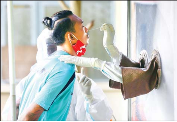
မြန်မာနေရှင်နယ်လိဂ် ကလပ်အသင်းများအား ကိုဗစ်-၁၉ ရောဂါ တို့ဖတ်နမူနာများ ရယူနေစဉ်။

ရန်ကုန် ဩဂုတ် ၁၀ မြန်မာနေရှင်နယ်လိဂ်သည် ပြည်တွင်း ဘောလုံးပြိုင်ပွဲများ ပြန်လည်ကျင်းပ နိုင်ရန် ကျန်းမာရေးနှင့် အားကစား ဝန်ကြီးဌာန၏ လမ်းညွှန်ချက်အတိုင်း ဆောင်ရွက်လျက်ရှိပြီး မြန်မာနေရှင်နယ် လိဂ်ကလပ်အသင်းများမှ အုပ်ချုပ်/ နည်းပြနှင့် ကစားသမားများကို ကိုဗစ်-၁၉ ရောဂါ တို့ဖတ်နမူနာ ရယူ စစ်ဆေးခဲ့သည်။