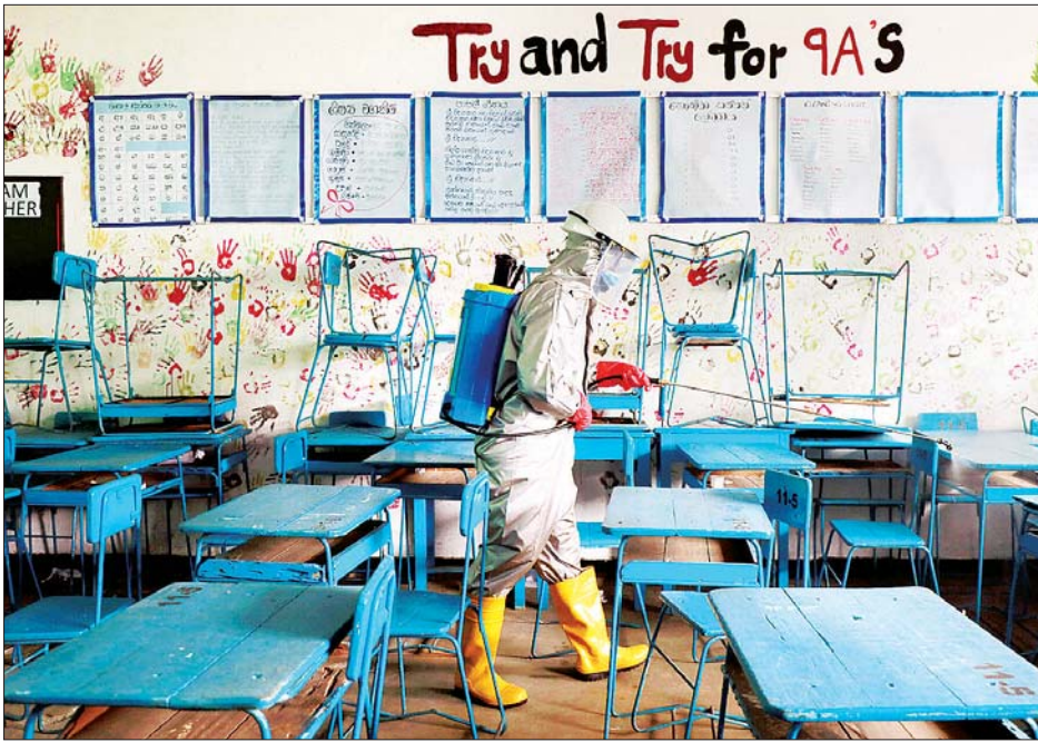
သီရိလင်္ကာနိုင်ငံရှိ စာသင်ကျောင်းတစ်ခုတွင် ကိုဗစ်-၁၉ ကာကွယ်ရန် စာသင်ခန်းများအတွင်း ဆေးဖျန်းနေစဉ်။

ထို့ပြင် ကျောင်းမုန့်ဈေးတန်း ကိုလည်း ကျန်းမာရေးအာဏာပိုင် များ၏ အတည်ပြုချက်ရရှိမှသာ ဖွင့်လှစ်ခွင့်ပြုမည်ဖြစ်ကြောင်း သိရ သည်။ သီရိလင်္ကာနိုင်ငံတွင် ကိုဗစ်- ၁၉ ကူးစက်ဖြစ်ပွားမှုကြောင့် ပြီးခဲ့ သည့် မတ်လလယ်မှစတင်ကာ စာသင်ကျောင်းများအားလုံးကို ပိတ် ထားခဲ့ရသည်။ ဆင်ဟွာ