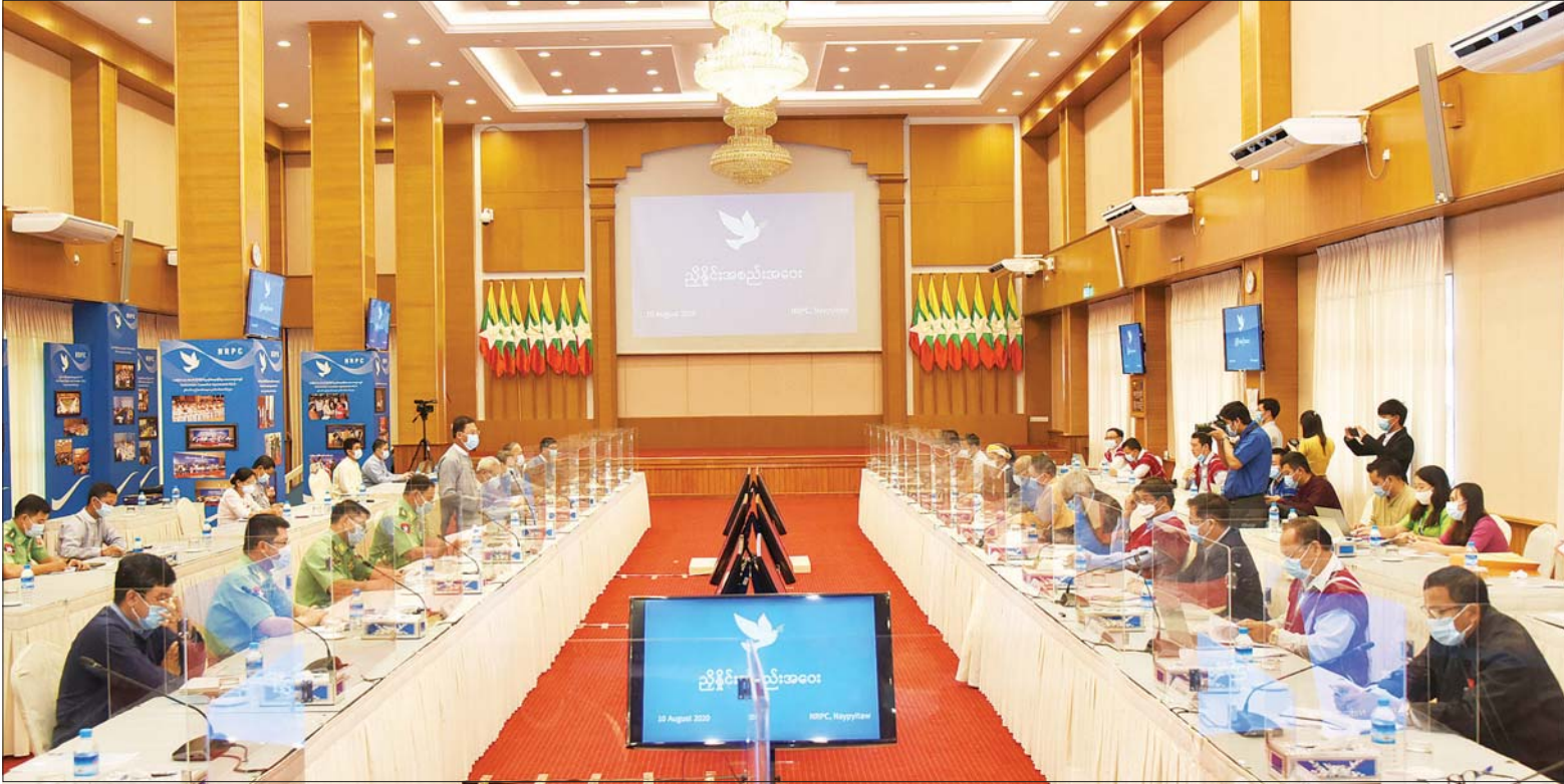
အမျိုးသားပြန်လည်သင့်မြတ်ရေးနှင့် ငြိမ်းချမ်းရေးဗဟိုဌာန ဒုတိယဥက္ကဋ္ဌ ပြည်ထောင်စုရှေ့နေချုပ် ဦးထွန်းထွန်းဦး JICM အကြံပြုညှိနှိုင်း အစည်းအဝေးတွင် အမှာစကားပြောကြားစဉ်။ သတင်းစဉ်

နေပြည်တော် ဩဂုတ် ၁၀ တစ်နိုင်ငံလုံး ပစ်ခတ်တိုက်ခိုက်မှု ရပ်စဲရေး သဘောတူစာချုပ် အကောင် အထည်ဖော်မှုဆိုင်ရာ ညှိနှိုင်းအစည်း အဝေး (JICM) အကြံပြုညှိနှိုင်းအစည်း အဝေးကို ယနေ့နံနက် ၁၀ နာရီတွင် နေပြည်တော်ရှိ အမျိုးသားပြန်လည် သင့်မြတ်ရေးနှင့် ငြိမ်းချမ်းရေးဗဟို ဌာန (NRPC) ၌ ကျင်းပသည်။ အစည်းအဝေးသို့ အစိုးရကိုယ်စား လှယ်များအဖြစ် အမျိုးသားပြန်လည် သင့်မြတ်ရေးနှင့် ငြိမ်းချမ်းရေး ဗဟိုဌာန ဒုတိယဥက္ကဋ္ဌ ပြည်ထောင်စု ရှေ့နေချုပ် ဦးထွန်းထွန်းဦး၊ ကာကွယ် ရေးဦးစီးချုပ်ရုံး(ကြည်း)မှ ဒုတိယ ဗိုလ်ချုပ်ကြီး ရာပြည့်၊ ဒုတိယ ဗိုလ်ချုပ်ကြီး မင်းနောင်နှင့် ဒုတိယ ဗိုလ်ချုပ်ကြီး တင်မောင်ဝင်း၊ ငြိမ်းချမ်း ရေးကော်မရှင်အတွင်းရေးမှူး ဒုတိယ ဗိုလ်ချုပ်ကြီး ခင်ဇော်ဦး(ငြိမ်း)၊ ပြည်သူ့လွှတ်တော် ကိုယ်စားလှယ် ဦးပြီးချို(ခ) ဦးဌေးဝင်းအောင်၊ စာမျက်နှာ ၁၀ ကော်လံ ၁ ❀