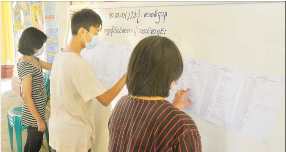
အ-ထ-က(၂)ဒဂုံတွင် တက္ကသိုလ်ဝင်အောင်စာရင်းကို ကျောင်းသား ကျောင်းသူများ လာရောက်ကြည့်ရှုစဉ်။

ရန်ကုန် ဩဂုတ် ၁၀ ၂၀၁၉-၂၀၂၀ ပညာသင်နှစ် တက္ကသိုလ်ဝင် အောင်စာရင်း များကို ဩဂုတ် ၁၀ ရက် နံနက်က ရန်ကုန်မြို့ အခြေခံ ပညာအထက်တန်းကျောင်းများ၌ ထုတ်ပြန်ကြေညာ ထားရာ ကျောင်းသား ကျောင်းသူများ လာရောက်ကြည့်ရှု ကြကြောင်း သိရသည်။ အဆိုပါ ၂၀၁၉-၂၀၂၀ ပညာသင်နှစ် တက္ကသိုလ်ဝင် စာမေးပွဲကို စာမျက်နှာ ၁၀ ကော်လံ ၆ ❀