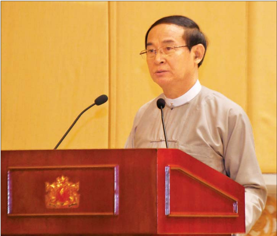
နိုင်ငံတော်သမ္မတ ဦးဝင်းမြင့် ၂၀၁၈ - ၂၀၁၉ စည်းကြပ်နှစ် ဝင်ငွေခွန်၊ ကုန်သွယ်လုပ်ငန်းခွန်နှင့် အထူးကုန်စည်ခွန် အများဆုံးပေးဆောင်ခဲ့သူများအား ဂုဏ်ပြုဆုချီးမြှင့်သည့် အခမ်းအနားတွင် အမှာစကား ပြောကြားစဉ်။ သတင်းစဉ်