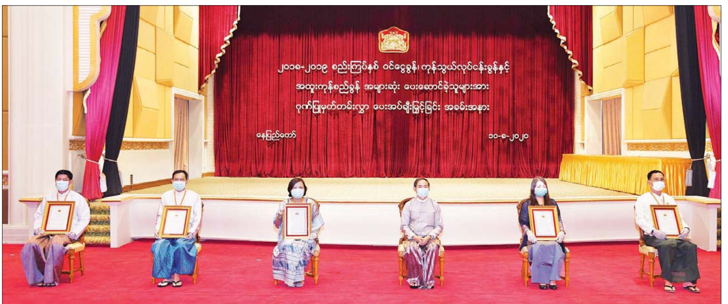
နိုင်ငံတော်သမ္မတ ဦးဝင်းမြင့် ၂၀၁၈-၂၀၁၉ စည်းကြပ်နှစ်အတွက် ကုန်သွယ်လုပ်ငန်းခွန် အများဆုံးပေးဆောင်ခဲ့ကြသော ပုဂ္ဂလိကပိုင် နိုင်ငံခြားကုမ္ပဏီများမှ တာဝန်ရှိသူများနှင့် စုပေါင်းမှတ်တမ်းတင် ဓာတ်ပုံရိုက်စဉ်။