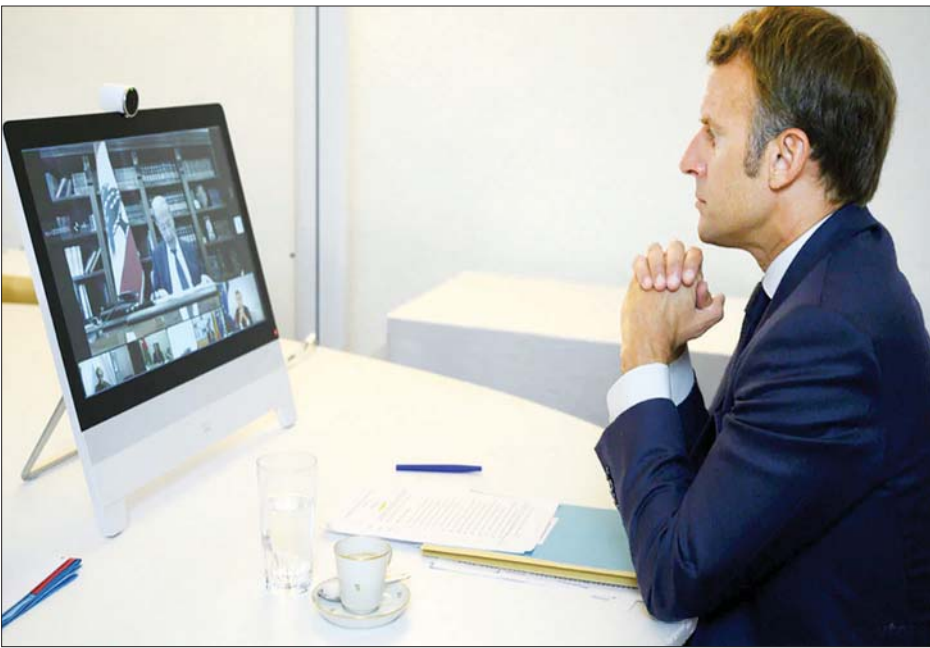
အွန်လိုင်းပေါ်တွင်ကျင်းပသည့် အလှူရှင်များအစည်းအဝေးတွင် ပါဝင်နေသည့် ပြင်သစ်သမ္မတ မာကရုန်ကို တွေ့ရစဉ်။

ပြင်သစ်သမ္မတ အီမန်နျယ်မာကရုန်က အစည်းအဝေးတွင် ပါဝင်ခဲ့ကြသူများကို လက်ဘနွန်နိုင်ငံအတွက် အကူအညီများ လျင်မြန်စွာ ပေးပို့ရန် ပြောကြားခဲ့သည်။ ယင်းကိစ္စနှင့်ပတ်သက်ပြီး ပြင်သစ်သမ္မတ