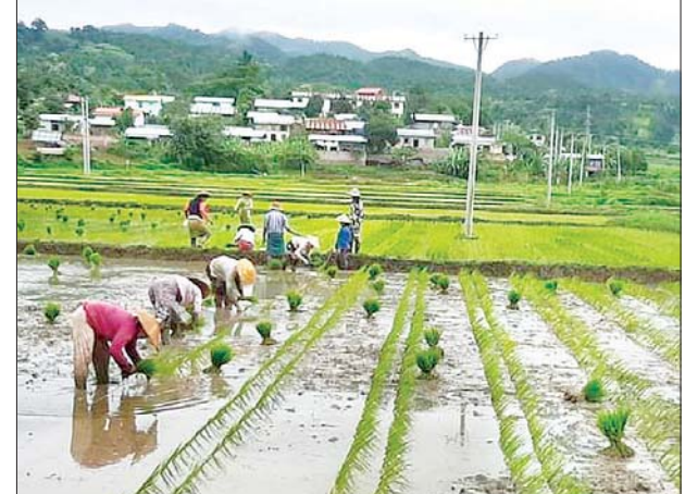
စိုင်း(သီပေါ)

ရှမ်းပြည်နယ်မြောက်ပိုင်း သီပေါမြို့နယ် စိုက်ပျိုးရေးဦးစီးဌာနအနေဖြင့် ကိုဗစ်-၁၉ စီးပွားရေးကုစားမှု အစီအစဉ်အရ မိုးစပါး (RS-CS) မျိုးစေ့ထုတ်စိုက်ခင်းများ စနစ်တကျ စိုက်ပျိုးရေးအတွက် ခြောက်တန်း တစ်တန်းလုပ်စနစ် လက်တွေ့ စိုက်ပျိုးပြသမှုကို ပေါ်ကြိုကျေးရွာ အုပ်စု ဆားတွင်းကျေးရွာနှင့် မန်တံ အုပ်စု နားခဲကျေးရွာတို့ရှိ တောင်သူများအား ဩဂုတ် ၁၀ ရက်က ပြသစဉ်။