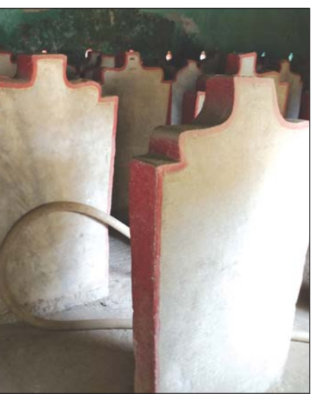
ပိဋကတ်တော် ကျောက်စာများ

ပိဋကတ်တော် ကျောက်စာများကို ရေးထိုးကြရာတွင် ဗုဒ္ဓဘုရားရှင်၏ ပိဋကတ်သုံးပုံဖြစ်သည့် သုတ္တန်၊ ဝိနည်း၊ အဘိဓမ္မာကျမ်းများကို ရေးထိုးကြသော်လည်း သင်္ဃန်းကျွန်း၊ မင်းကင်း၊ သုံးခွဲမြို့နယ် မင်းရွာနှင့် ဝမ်းတွင်းမြို့နယ် ဘုရားစုကျေးရွာရှိ ကျောက်စာချပ်များတွင် ဝိနည်းကျမ်း တစ်ခုတည်းကိုသာ ရေးထိုးထားပြီး ပဲခူး ရွှေသာလျောင်းဘုရားမှ ကျောက်စာများတွင်မူ အဘိဓမ္မာကျမ်းများကိုသာ