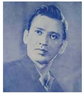
ကျော်ဆွေ