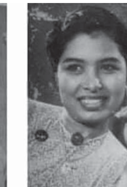
မြင့်မြင့်ခင်

ပြုသမျှ ကုသိုလ်ကောင်းမှုတွေအားလုံးကို အမျှပေးဝေပါတယ်။ နောက်ပြီးတော့ ရတနာသုံးပါးကို မမေ့ဖို့ဆိုတာ အဲဒါလေး တစ်ခုတော့ မငွေ ပြောချင်ပါတယ်။ ရုပ်ရှင် လောကသားတွေလည်း အားလုံး ချစ်ချစ် ခင်ခင်နဲ့ ညီညီညွတ်ညွတ်နဲ့ တစ်ယောက်နဲ့ တစ်ယောက် ကူညီပြီးတော့ ဆက်လက် ပြီးတော့ ရှင်သန်နိုင်ပါစေလို့ ဘုရားတရား မမေ့ဘဲ နေနိုင်ကြပါစေလို့။