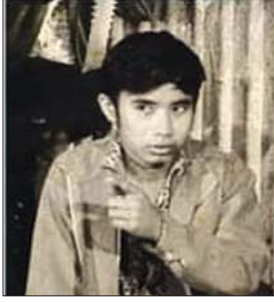
ကိုမြင့်