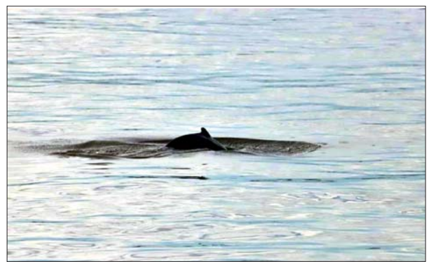
ထိန်းသိမ်းရေးဧရိယာအတွင်းရှိ ရောဂါတိုင်းပိုင်တစ်ကောင်ကို တွေ့ရစဉ်။

နေရခြင်းမှာ တံငါသည်များနှင့် ပူးပေါင်းပြီး ငါးဖမ်းသည့်အလုပ်အား ဆောင်ရွက်နေပုံများကို နိုင်ငံတကာမှ စိတ်ဝင်စားခြင်းခံရပြီး အကယ်၍ လင်းပိုင်များအားလုံး သေဆုံးသွားပါက ကမ္ဘာလှည့်ခရီးသွားလုပ်ငန်းများ လျော့ကျသွားနိုင်ကြောင်း၊ ၎င်းက ဆက်လက်ပြောကြားသည်။