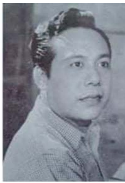
တင်ညွန့်