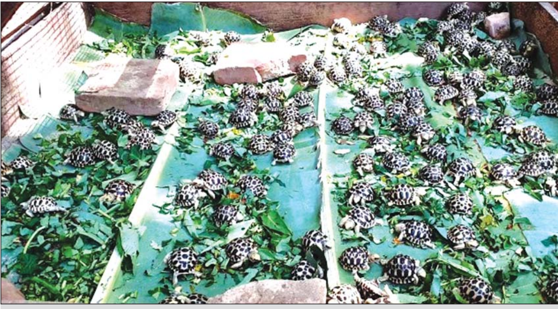
လောကနန္ဒာဘေးမဲ့တောဥယျာဉ် မွေးမြူထားသည့် ကြယ်လိပ်များ။

နေ့စဉ်အစောကျွေးချိန်တွင် ကျန်းမာရေး စစ်ပေးခြင်း၊ ကျန်းမာရေးမကောင်းပါက သီးသန့်ခွဲထား၍ ဆေးထိုးကုသပေးခြင်း၊ သဘာဝဓာတ်စားများကျွေးခြင်း၊ ကြယ်လိပ် သားပေါက်ငယ်များကို နေ့စဉ်ရေစိမ့်ရေတိုက်ပေးခြင်းတို့ကို ပြုလုပ်ပေးနိုင်ခြင်း၊ အပူချိန် မြင့်မားသောအခါများတွင်လည်း ရေစိမ့်ကန်များ၊ သောက်ရေကန်ငယ်များ ပြုလုပ်ပေး၍ အတွင်းမှမြေပေါ်သို့ ရောက်ရှိလာနိုင်ကြမည်ဟု ခန့်မှန်းရသည်။ မြေပေါ်ရောက်ရှိလာသည့်အခါတွင်လည်း သားရဲတိရစ္ဆာန်များ ဖမ်းဆီးခြင်း၊ သတ်ဖြတ်ခြင်း၊ လူပယောဂများနှင့် ဂေဟစနစ်များပျက်စီးလာခြင်းများအပြင် အခြားပျက်စီးစေနိုင်သော အကြောင်းအမျိုးမျိုးလည်း ရှိနိုင်ခြင်းကြောင့် သဘာဝတောများထဲတွင် မြန်မာ့ကြယ်လိပ်များ