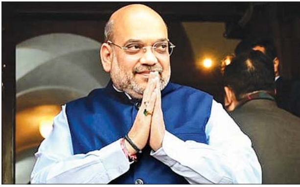
အိန္ဒိယဝန်ကြီးချုပ်ပြည်ထဲရေးဝန်ကြီး အမတ်ရှား

နယူးဒေလီ ဩဂုတ် ၃ အိန္ဒိယဝန်ကြီးချုပ် နာရန်ဒရာမိုဒီ၏ အနီးကပ်လက်ထောက်တစ်ဦးဖြစ်သူ ပြည်ထဲရေးဝန်ကြီးတွင် ကိုဗစ် - ၁၉ ကူးစက်ခံထားရကြောင်း သိရသည်။ ပြည်ထဲရေးဝန်ကြီးအမတ်ရှားက ၎င်းတွင် ကိုဗစ်-၁၉ ကူးစက်ခံထားရကြောင်း ဩဂုတ် ၁ ရက်တွင် ပြောကြားခဲ့သည်။ ကျန်းမာရေးအခြေအနေကောင်းမွန်နေသော်လည်း ဆရာဝန်၏ အကြံပြုချက်ဖြင့် ဆေးရုံတွင် တက်ရောက်ကုသမှု ခံယူနေကြောင်း ၎င်းက ပြောကြားခဲ့သည်။ လွန်ခဲ့သည့်ရက်အနည်းငယ်အတွင်း ၎င်းနှင့် ထိတွေ့ခဲ့သူများအားလုံး ဆေးစစ်မှုခံယူကြရန်နှင့် သီးခြားခွဲနေကြရန် ပြည်ထဲရေးဝန်ကြီးက တိုက်တွန်းခဲ့သည်။ လွန်ခဲ့သည့်သီတင်းပတ်အတွင်း ပြုလုပ်ခဲ့သည့် အစိုးရအဖွဲ့အစည်းအဝေးတွင် ဝန်ကြီးချုပ်မိုဒီနှင့် အခြားသောအစိုးရအဖွဲ့ဝင်များသည် လူမှုဝေးကွာပုံစံအတိုင်းအစည်းအဝေးကို ကျင်းပခဲ့ကြခြင်းဖြစ်ကြောင်း အိန္ဒိယမီဒီယာများတွင် ဖော်ပြကြသည်။ အိန္ဒိယနိုင်ငံတွင် ကိုဗစ် - ၁၉ ကူးစက်ခံရသူ ၁ ဒသမ ၇၆ သန်း ရှိပြီး ကမ္ဘာပေါ်တွင် အမေရိကန်နှင့် ဘရာဇီးတို့ပြီးလျှင် တတိယကူးစက်မှု အမြင့်ဆုံးနိုင်ငံလည်း ဖြစ်သည်။ အင်န်အိတ်ချီကေ