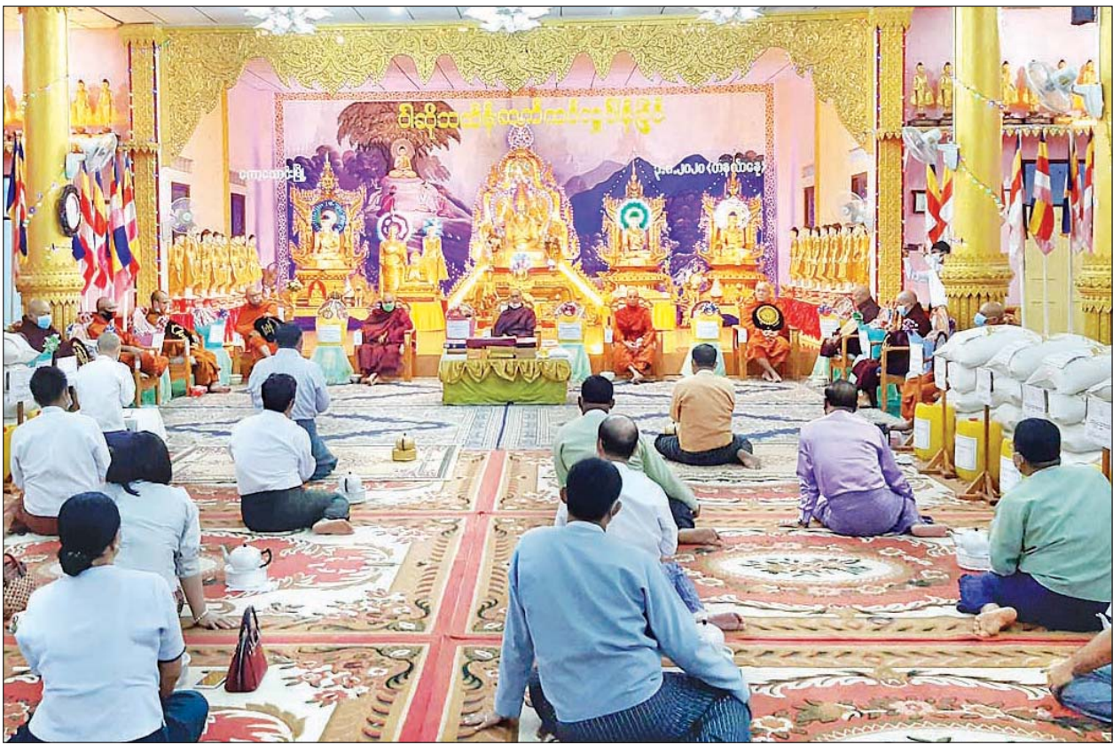
ကော့သောင်းခရိုင်၊ မြို့နယ် ဌာနဆိုင်ရာ ဝါဆိုသင်္ကန်း ဆက်ကပ်လှူဒါန်းပွဲအခမ်းအနားကို ဩဂုတ် ၃ ရက်က ကော့သောင်းမြို့၊ ပြည်တော်အေးသာသနာ့ဗိမ္မာန်တော်၌ ကျင်းပရာ ဆရာတော် သံဃာတော်များထံမှ တနင်္သာရီတိုင်းဒေသကြီးဝန်ကြီးချုပ် ဦးမြင့်မောင်နှင့် ဌာနဆိုင်ရာများက ငါးပါးသီလခံယူ ဆောက်တည်ကြစဉ်။