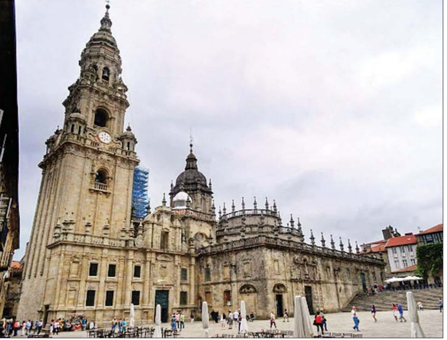
စပိန်နိုင်ငံရှိ နိုင်ငံခြားသားများသွားရောက်လေ့လာလေ့ရှိရာ ထင်ရှားသော ဆန်တီယာဂို ဒီကွန်ပိုစတီလာ အဆောက်အအုံကြီးကို ခမ်းနားထည်ဝါစွာတွေ့ရစဉ်။

ကိုဗစ် - ၁၉ ရောဂါကြောင့် ဒုတိယသုံးလပတ်မှာ စပိန်တစ်သန်းကျော်မှာ ခရီးသွားကဏ္ဍမှာ အလုပ်တွေ ဆုံးရှုံးခဲ့ကြပါတယ်။ သို့သော်လည်း စပိန်အစိုးရက အလုပ်အကိုင်ရှေးကွက်ရဲ့ အဆိုးဆုံးအခြေအနေက ကျော်လွှားလာခဲ့ပြီလို့ ပြောကြားလိုက်ပါတယ်။ အမျိုးသားစာရင်းအင်းဆိုင်ရာအဖွဲ့အစည်းက အလုပ်လက်မဲ့အရေအတွက်ဟာ ဧပြီလနဲ့ ဇွန်လကြားမှာ ၅၅၀၀၀ အထိရောက်ရှိလာပြီး ၃ ဒသမ ၄ သန်းအထိ မြင့်တက်လာကြောင်း ဖော်ပြလိုက်ပါတယ်။