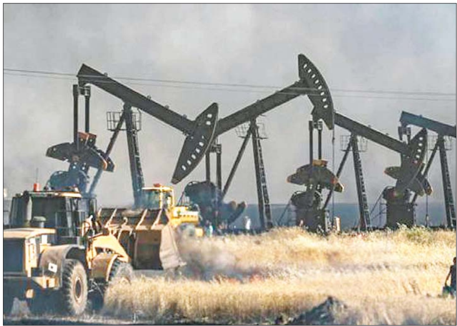
ဆီးရီးယားရှိ ရေနံတူးဖော်ရေးနယ်မြေကို တွေ့ရစဉ်။

ဒမတ်စကတ် ဩဂုတ် ၃ ဆီးရီးယား အရှေ့မြောက်ပိုင်းရှိ ကျွန်ုပ်တို့ဆောင်သည့် တပ်ဖွဲ့များနှင့် အမေရိကန် ရေနံကုမ္ပဏီတို့အကြား ရေနံစာချုပ် ပြုလုပ်ခဲ့သည့်အတွက် တူရကီတို့က အကြီးအကျယ် ဒေါသထွက်လျက်ရှိသည်။ ယင်းသို့ပြုလုပ်မှုသည် လက်ခံနိုင်ဖွယ်ရာမရှိသကဲ့သို့ အကြမ်းဖက်သမားများကို ငွေကြေးထောက်ပံ့နေမှု ပင်ဖြစ်သည်ဟု တူရကီတို့က စွပ်စွဲခဲ့သည်။ ရေနံနယ်မြေများကို ခေတ်မီတိုးတက်စေရန် ဆီးရီးယားဒီမိုကရက်တစ်တပ် (အက်စ်ဒီအက်စ်)နှင့် အမေရိကန် ရေနံကုမ္ပဏီတို့အကြား သဘောတူညီမှုတွင် လက်မှတ်ရေးထိုးခဲ့ကြောင်း အမေရိကန်အရာရှိပိုင်းက အတည်ပြုပြောကြားခဲ့သည်။ ဆီးရီးယားအစိုးရကမူ ယင်းလုပ်ရပ်မှာ ခိုးယူသည့် လုပ်ရပ်ဖြစ်ပြီး နိုင်ငံတော်၏ အချုပ်အခြာကို ချိုးဖောက်ခြင်းပင်ဖြစ်သည်ဟု ရှုတ်ချခဲ့သည်။ ဆီးရီးယား ဒီမိုကရက်တစ်တပ်သည် ကျွန်ုပ်တို့နှင့် ဆီးရီးယားနိုင်ငံ အရှေ့မြောက်ပိုင်းတွင် ကိုယ်ပိုင်အုပ်ချုပ်ခွင့်ရရန် ကြိုးပမ်းနေသည့်အဖွဲ့ဖြစ်ကာ တိုင်းပြည်၏ အကြီးဆုံး ရေနံမြေများကို ထိန်းချုပ်ထားသည်။