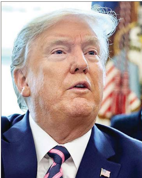
အမေရိကန်သမ္မတ ဒေါ်နယ်ထရမ်

ကြောင်း ပြောကြားခဲ့သည်။ အမေရိကန် ရွေးကောက်ပွဲ အတွက် ပြည်သူများဆန္ဒမဲ ထည့်ဝင် မှုကို နိုဝင်ဘာ ၃ ရက်တွင် စတင်မည် ဖြစ်ကြောင်း သိရသည်။ အင်န်အိတ်ချ်ကေ