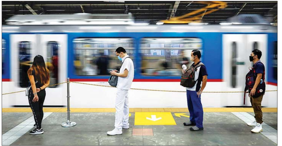
အများပြည်သူသယ်ယူပို့ဆောင်ရေးယာဉ်ဖြင့် စီးနင်းလိုက်ပါရန် စောင့်ဆိုင်းနေကြသည့် ဖိလစ်ပိုင်ပြည်သူများ။

ဖိလစ်ပိုင်နိုင်ငံတစ်ဝန်း ဩဂုတ် ၂ ရက်တွင် ကိုဗစ်-၁၉ ကူးစက်ခံရသူ ၅၀၂၂ ဦးရှိခဲ့ပြီး ရောဂါကူးစက်ခံရသူ အရေအတွက် စုစုပေါင်း ၁၀၀၀၀၀ အထိ ဖြစ်လာခဲ့သည်။ အင်န်အိတ်ချ်ကေ