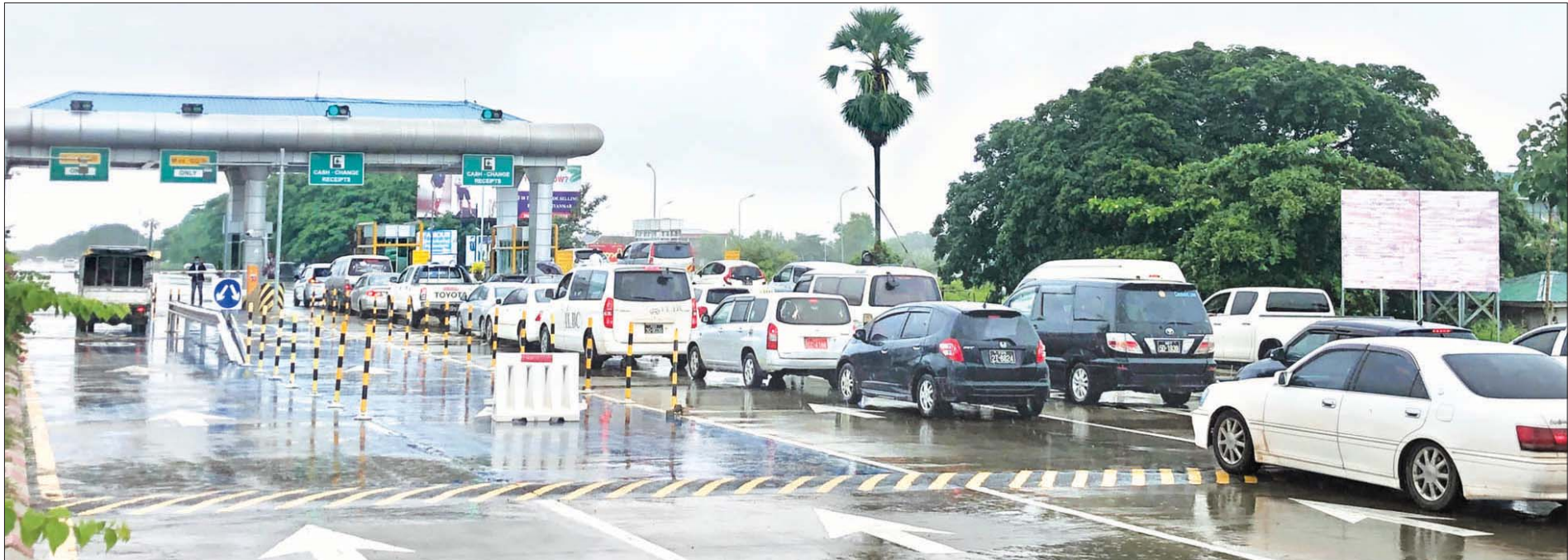
ရန်ကုန်-မန္တလေး အမြန်လမ်းမကြီး၌ ခရီးသွားကားများကို တွေ့ရစဉ်။