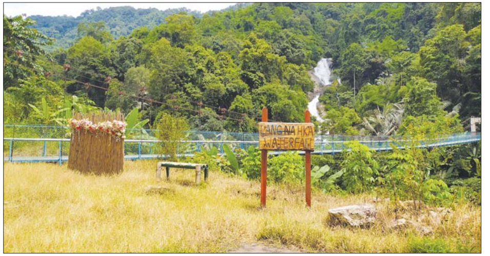
ဆန်းလန်နရေတံခွန်အပန်းဖြေစခန်းကို တွေ့ရစဉ်။

ပြည်သူများအနေဖြင့် ကျန်းမာရေးနှင့် အားကစားဝန်ကြီးဌာနမှ ကျန်းမာရေးလမ်းညွှန်ချက်များနှင့် အညီ ရေတံခွန်အဝင်ပေါက်တွင် ကိုယ်အပူချိန်တိုင်းတာခြင်း၊ လက်ဆေးခြင်း၊ နှာခေါင်းစည်းတပ်ခြင်း၊ ခရီးသွားမှတ်တမ်းများ ရေးသွင်းထားခြင်း စသည့် ကိုဗစ် - ၁၉ ရောဂါ ကြိုတင်ကာကွယ်ရေးနည်းလမ်းများ ဆောင်ရွက်ထားကြောင်း ဆန်းလန်နရေတံခွန် တာဝန်ခံ ဦးလွမ်းခေါင်ထံမှ သိရသည်။ ကျော်နိုင်ဌေး (ပြန်/ဆက်)