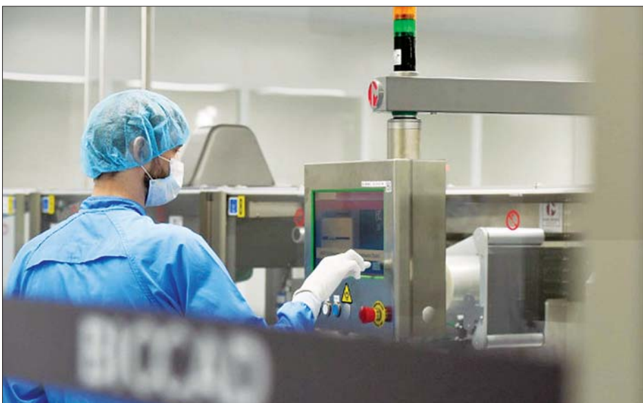
ရုရှားဇီဝနည်းပညာကုမ္ပဏီမှ ဝန်ထမ်းတစ်ဦးကို တွေ့ရစဉ်။