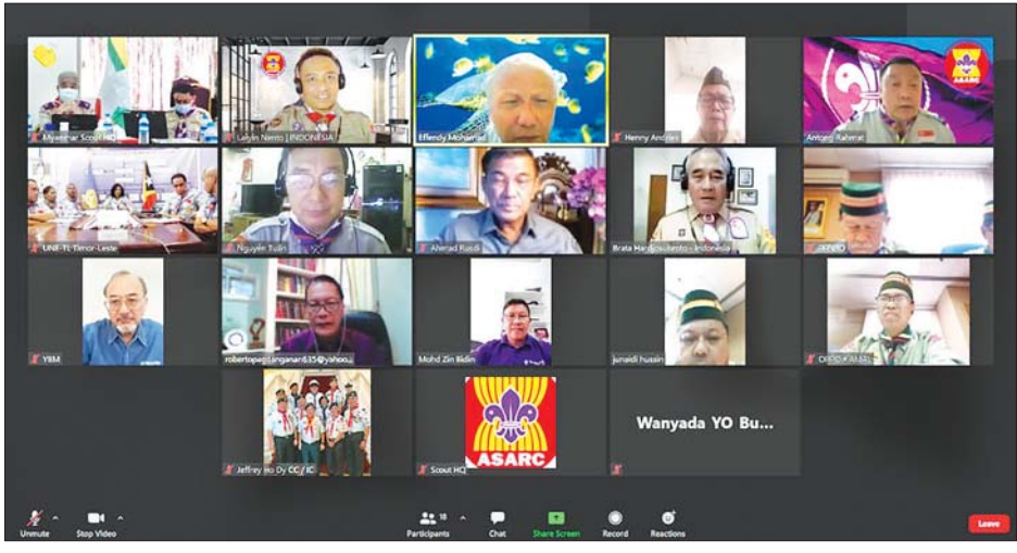
အာဆီယံအဖွဲ့ဝင်နိုင်ငံများ၏ ဒေသတွင်းအဆင့်မြင့်ကင်းထောက်ခေါင်းဆောင်များ ထိပ်သီးဆွေးနွေးပွဲတွင် မြန်မာနိုင်ငံ ကင်းထောက်အဖွဲ့ကိုယ်စားလှယ်များက Video Conferencing ဖြင့် ပါဝင်ဆွေးနွေးကြစဉ်။

အနေ သုံးသပ်ရှင်းလင်း ဆွေးနွေးကြသည်။ ယင်းဆွေးနွေးပွဲတွင် မြန်မာနိုင်ငံ ကင်းထောက်ကိုယ်စားလှယ်များ ကိုဗစ်-၁၉ ကာလအတွင်း ကင်းထောက်လှုပ်ရှားမှုများ စဉ်ဆက်မပြတ် လှုပ်ရှားဆောင်ရွက်မှု၊ နိုင်ငံတော်အစိုးရ၏ ညွှန်ကြားချက်များနှင့်အညီ ရောဂါကာကွယ်တားဆီးရေးလုပ်ငန်းများ၊ အသိပညာပေးလုပ်ငန်းများ၊ ထောက်ပံ့လှူဒါန်းခြင်းများကို ဒေသခံအဖွဲ့အစည်းများ၊ ပြည်သူများနှင့် ပူးပေါင်းကူညီဆောင်ရွက်ခဲ့မှုများကို တင်ပြဆွေးနွေးသည်။ အဆိုပါဆွေးနွေးပွဲကို မြန်မာနိုင်ငံ ကင်းထောက်အဖွဲ့ အမျိုးသားကင်းထောက်ချုပ် ဒေါက်တာတင်ညို၊ နိုင်ငံတကာဆိုင်ရာ၊ အစီအစဉ်ဆိုင်ရာ၊ သင်တန်းဆိုင်ရာ ကင်းထောက်များ