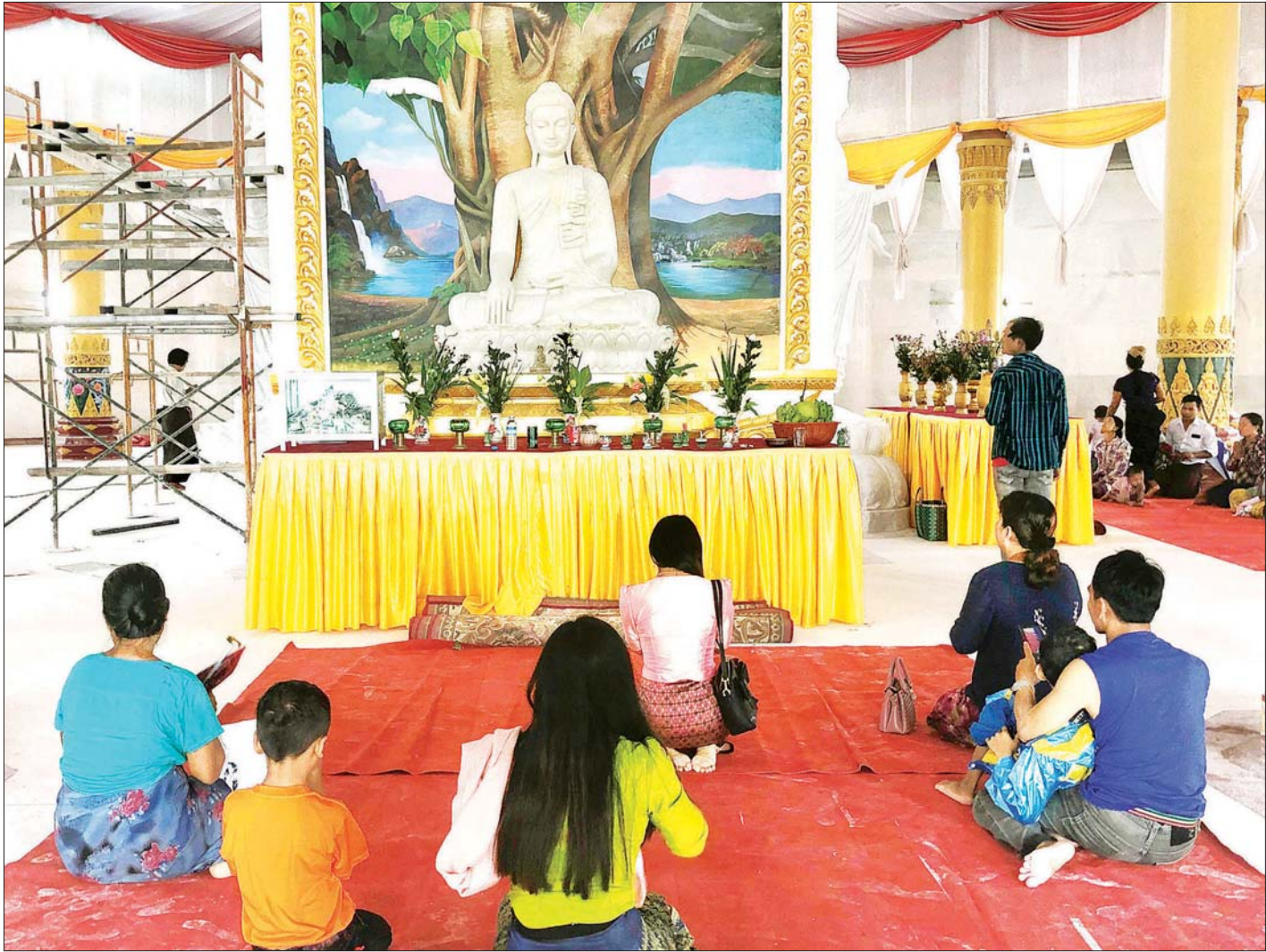
နေပြည်တော်ရှိ ထာဝရငြိမ်းချမ်းရေးစေတီတော်တွင် ဘုရားဖူးများ လာရောက်ဖူးမြော်ကြည်ညိုကြစဉ်။