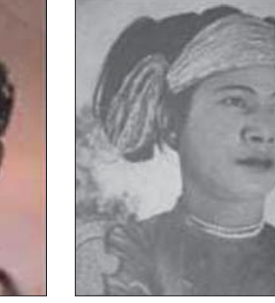
ဒိုင်ဗင်တင်လှ