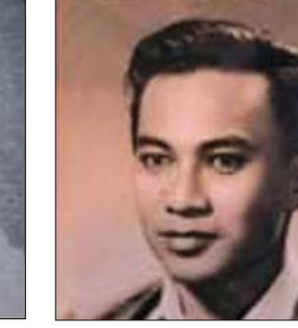
ဝင်းညွန့်