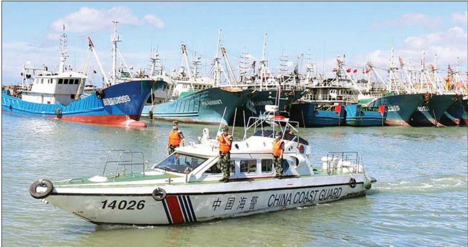
ဖူကျန်းပြည်နယ်၌ မုန်တိုင်းအန္တရာယ်ကြောင့် ဆိပ်ကမ်းသို့ပြန်ကပ်လာသည့် ငါးဖမ်းလှေအချို့ကို တွေ့ရစဉ်။

နှင့် အန္တရာယ်ရှိသည့်နေရာများတွင် နေထိုင်ကြသည့် ပြည်သူများကို အချိန်မီ ကယ်ဆယ်ရွှေ့ပြောင်းရေး လုပ်ဆောင်ကြရန်၊ အဝေးရောက်နေ သည့် သင်္ဘောများ ဆိပ်ကမ်းသို့ ပြန်လာကြရန် အာဏာပိုင်များက ညွှန်ကြားထားသည်။ ဆင်ပွာ