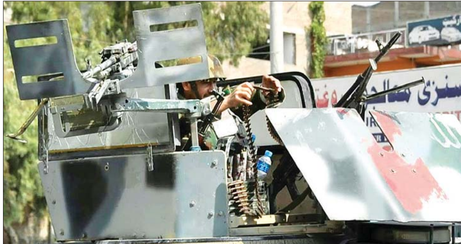
အကျဉ်းထောင်အနီးတွင် လုံခြုံရေးတာဝန်ယူနေသည့် အာဖဂန်အစိုးရတပ်ဖွဲ့ဝင်တစ်ဦးကို တွေ့ရစဉ်။