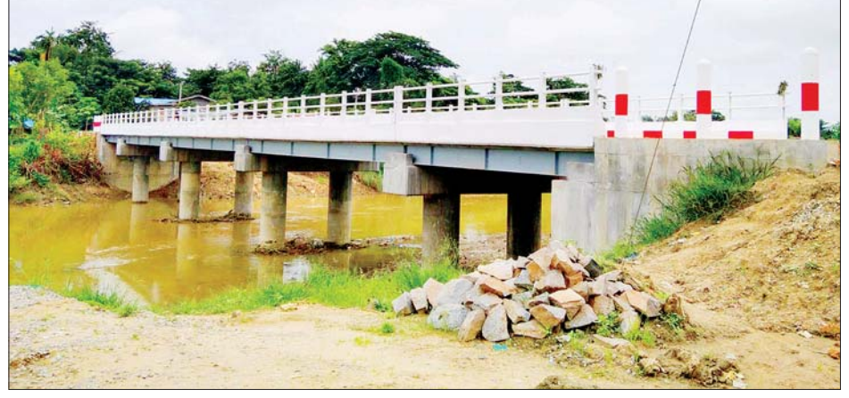
ကွန်ကရစ်တံတားသစ်အဖြစ် အသစ်တည်ဆောက်ထားမှုကို တွေ့ရစဉ်။