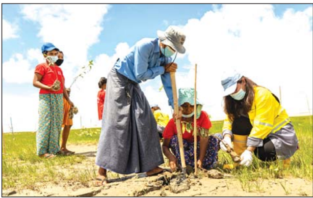
ပျိုးပင်များ စနစ်တကျ စိုက်ပျိုးခြင်းဖြစ်သည်။

ဒီရေတောများသည် လူ့အဖွဲ့အစည်းနှင့်ပတ်ဝန်းကျင်ကို များစွာအကျိုးဖြစ်ထွန်းစေမှုကြောင့် JFE MERANTI Myanmar မှ ဒီရေတောရိယာများအား