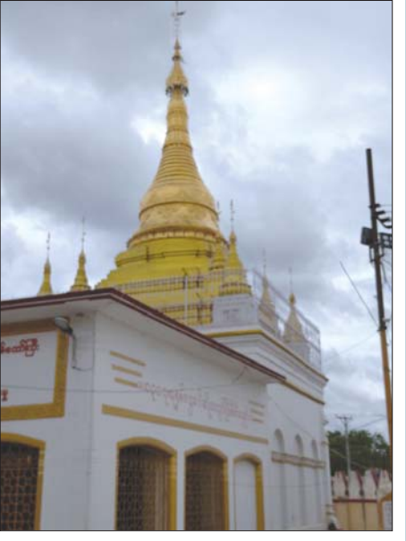
မိတ္ထီလာမြို့မှ ထီးသုံးဆင့် စေတီတော်

မိတ္ထီလာကန်သည် မြန်မာနိုင်ငံအလယ်ပိုင်းအတွက် အရေးပါသော ရေအရင်းအမြစ်နေရာတစ်ခုဖြစ်၍ မိတ္ထီလာမြို့နှင့်အနီးဝန်းကျင်ဒေသများမှ နယ်သူ နယ်သားများသည် မိတ္ထီလာကန်ရေကို စိုက်ပျိုးရေးလုပ်ငန်းများတွင် ခေတ်အဆက်ဆက် အသုံးပြုခဲ့ကြသည်။ အထက်ဗမာပြည်