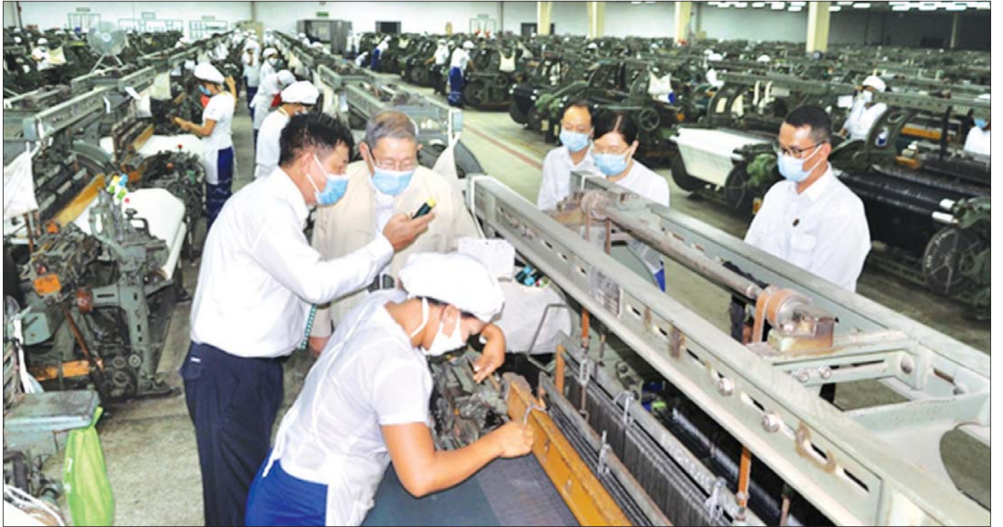
ပြည်ထောင်စုဝန်ကြီး ဦးစိုးဝင်း မကွေးတိုင်းဒေသကြီး ပခုက္ကူမြို့ရှိ အမှတ်(၅)အထည်စက်ရုံ၌ ကြည့်ရှုစစ်ဆေးစဉ်။

တင်ပြချက်များနှင့်စပ်လျဉ်း၍ ပြည်ထောင်စုဝန်ကြီးက သမားရိုးကျချည်များထုတ်လုပ်နေရာမှ ဆန်းသစ်တီထွင်၍ ဈေးကွက်ဝင် ချည်အမျိုးမျိုးကို ဖန်တီးထုတ်လုပ်ပြီး သွင်းကုန်အစားထိုးစနစ်ကို ဝိပီပြင်ပြင် အကောင်အထည်ဖော်ရန်၊ ထုတ်ကုန်အရည်အသွေး တိုးတက်ကောင်းမွန်စေရေးအတွက် ကုန်ထုတ်လုပ်မှု နည်းစဉ်တစ်လျှောက်အား တာဝန်ရှိသူအဆင့်ဆင့်က တိတိကျကျ စစ်ဆေးကြပ်မတ်ဆောင်ရွက်ရန်၊ ဈေးကွက်သုတေသန လုပ်ငန်းများကို ဆောင်ရွက်ရန်၊ ကုန်ထုတ်လုပ်မှုစရိတ် လျော့ချနိုင်ရေးအတွက် အလေအလွင့်မရှိအောင် စနစ်တကျ ကြပ်မတ်ဆောင်ရွက်ရန်၊ စက်စွမ်းအားပြည့် လည်ပတ်နိုင်ရေးအတွက် စက်အားလုံးပြုပြင်ထိန်းသိမ်းရေး လုပ်ငန်းများကို အစဉ်အမြဲ ဆောင်ရွက်ရန်၊ ဝန်ထမ်းများအနေဖြင့် လုပ်ငန်းတာဝန်များကို စိတ်ဝင်တစားဖြင့် မှန်မှန်နှင့် မြန်မြန် ဆောင်ရွက်ရန်၊ စက်ရုံအား ပုဂ္ဂလိကနှင့် ပူးပေါင်း၍ (PPP)ဆောင်ရွက်ရာတွင် အဆင်သင့်ဖြစ်စေရေး ကြိုတင်ပြင်ဆင်ထားရှိရန်၊ မီးဘေးအန္တရာယ် မဖြစ်ပွားစေရေးအတွက် စီမံချက်များရေးဆွဲ၍ ဇာတ်တိုက်လေ့ကျင့်ရန်နှင့် မီးငြိမ်းသတ်ရေး အထောက်အကူပစ္စည်းများအား အဆင်သင့်ပြင်ဆင်ထားရှိရန်၊ ဝန်ထမ်းများအနေဖြင့် ကိုဗစ်-၁၉ ကပ်ရောဂါ ဖြစ်ပွားစေစဉ် ကာလအတွင်း Coronavirus Disease 2019 (COVID-19) ကာကွယ်၊ ထိန်းချုပ်၊ ကုသရေး အမျိုးသားအဆင့် ဗဟိုကော်မတီနှင့်