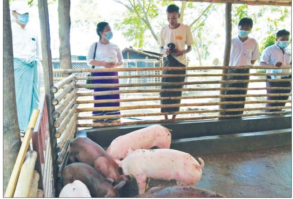
ကံမမြို့နယ်ရှိ ဝက်မွေးမြူရေးခြံသို့ မွေးမြူရေးနှင့် ကုသရေးဦးစီးဌာနမှ တာဝန်ရှိသူများ သွားရောက်စစ်ဆေးစဉ်။

အချိန်မီ သတင်းပေးပို့နိုင်ရန် မှာကြားခဲ့ပြီး လက်ကမ်းစာစောင် ဖြန့်ဝေပေးခဲ့ကြောင်း သိရသည်။