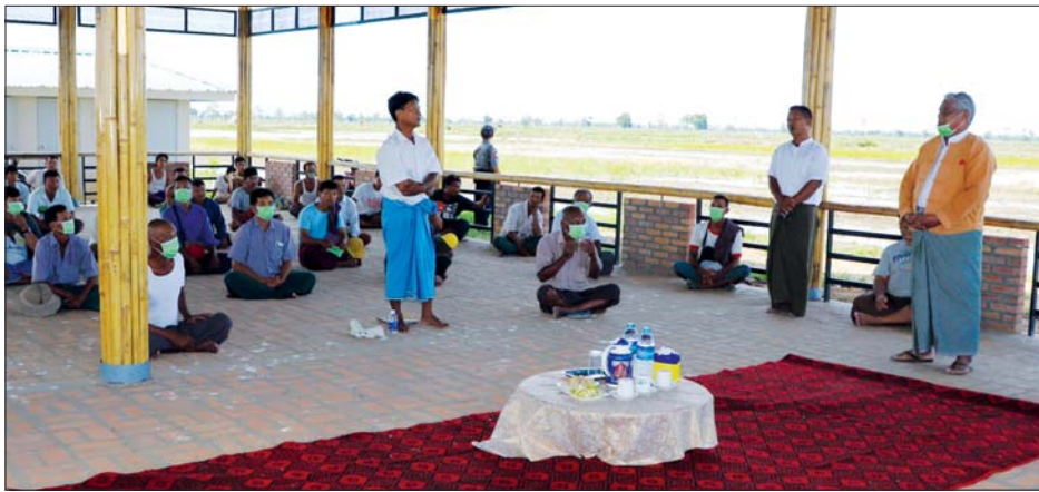
တိုင်းဒေသကြီးဝန်ကြီးချုပ် ဒေါက်တာမြင့်နိုင် ရွှေဘိုမြို့နယ်ရှိ ဒေသဖွံ့ဖြိုးရေးလုပ်ငန်းနှင့် တွေ့ဆုံစဉ်။

ရွှေဘို ဩဂုတ် ၃ စစ်ကိုင်းတိုင်းဒေသကြီး ဝန်ကြီးချုပ် ဒေါက်တာမြင့်နိုင်သည် ယမန်နေ့က ရွှေဘိုမြို့နယ်နှင့် ခင်ဦးမြို့နယ်အတွင်းရှိ ဒေသဖွံ့ဖြိုးရေးလုပ်ငန်းများ၏ မိုးစပါး စိုက်ပျိုးရေး ဖူလုံစွာရရှိရေး သက်ဆိုင်ရာတာဝန်ရှိသူများနှင့် ပေါင်းစပ်ညှိနှိုင်းပေးပြီး ဒေသဖွံ့ဖြိုးရေးလုပ်ငန်းများ ဆောင်ရွက်နေမှုတို့ကို ကြည့်ရှု စစ်ဆေးသည်။ တိုင်းဒေသကြီးဝန်ကြီးချုပ်နှင့်အဖွဲ့သည် ရွှေဘိုမြို့နယ် လိပ်ချင်းကျေးရွာအနီးရှိ ရှေ့ပြေး အဆင့်မြင့် လယ်ယာမြေ ဖော်ဆောင်ခြင်း စီမံကိန်းရှင်းလင်းဆောင်တွင် ဒေသခံ တောင်သူများနှင့် တွေ့ဆုံရာ ဆည်မြောင်းဦးစီးဌာနမှ စိုက်ပျိုးရေးပေးပေးမှု အခြေအနေများကိုလည်းကောင်း၊ စီမံကိန်းရေးရာအဖွဲ့အစည်းများ ပါဝင်သည့် တောင်သူများ၏