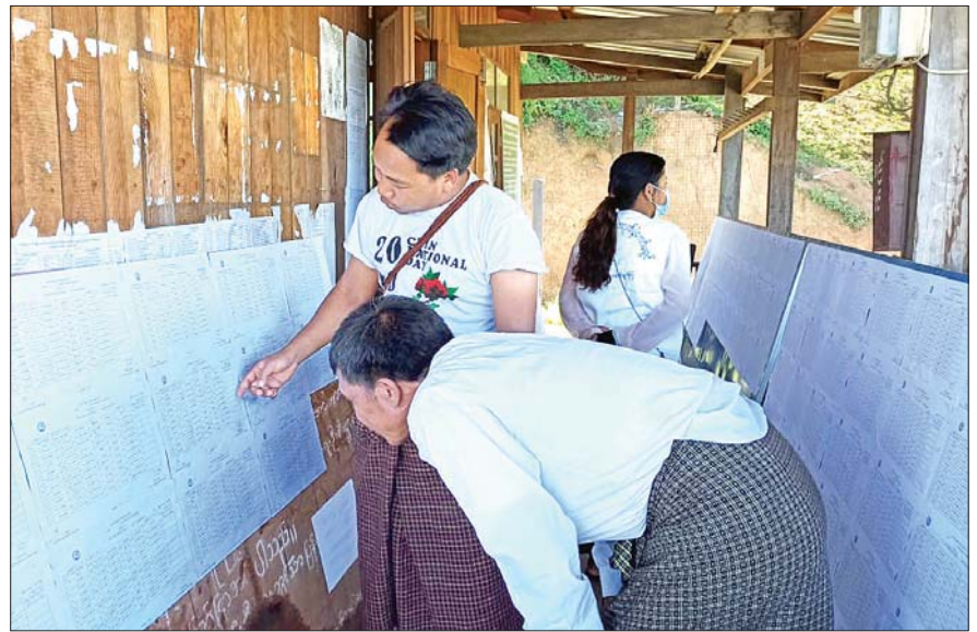
အထွေထွေရွေးကောက်ပွဲတွင် မဲပေးနိုင်ရေးအတွက် မဲစာရင်းလာရောက်ကြည့်ရှုသူများကို တွေ့ရစဉ်။