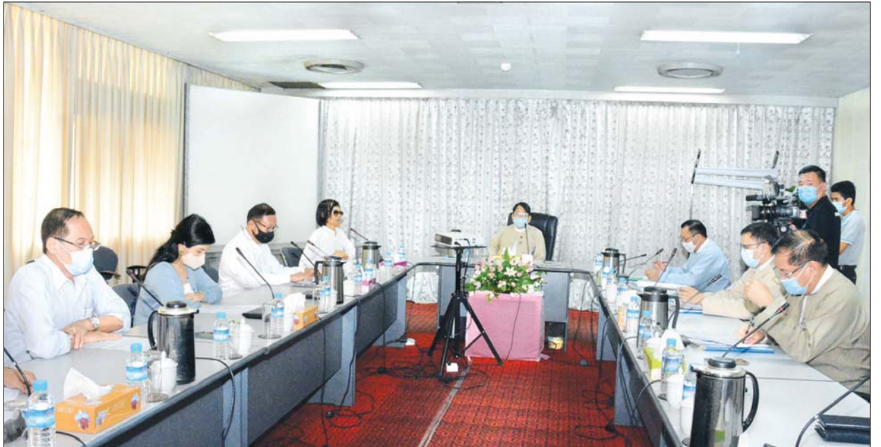
ပြည်ထောင်စုဝန်ကြီး ဒေါက်တာဖေမြင့် မြန်မာနိုင်ငံ တေးသံရုံးများအသင်းမှ ကိုယ်စားလှယ်များ၊ ဂီတပညာရှင်များနှင့် တွေ့ဆုံဆွေးနွေးစဉ်။ သတင်းစဉ်

တွေ့ဆုံစဉ် ဂီတအဖွဲ့အစည်းဆိုင်ရာများနှင့် မူပိုင်ခွင့်ဆိုင်ရာကိစ္စရပ်များကို ဆွေးနွေးခဲ့ကြသည်။