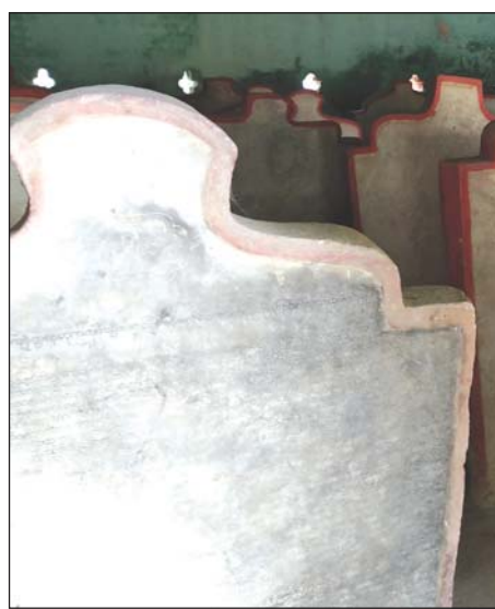
မိတ္ထီလာမြို့ ရွှေမြင်မိစေတီတော်ဝင်းအတွင်းမှ ပိဋကတ်တော် ကျောက်စာချပ်များ

ပိဋကတ်သုံးပုံ အဋ္ဌကထာနှင့် ဋီကာ ကျောက်စာ ၁၇၇၂ ချပ်နှင့် မှတ်တမ်းကျောက်စာချပ် နှစ်ချပ်ကို စန္ဒာမုနိဘုရား ပရိဝုဏ်အတွင်း၌ အုတ်ပလ္လင်တစ်ခုစီပေါ်တွင် တစ်ချပ်မှ သုံးချပ်အထိ စိုက်ထူပြီး အုတ်ပလ္လင်အထက်တွင် စေတီတော်တစ်ဆူစီ တည်ထား၍ "ဥဒေတယ၊ ကျောက်ချပ်မှန်" ဟု မှတ်သားခဲ့ကြသည်။ ယင်းကျောက်စာများကို ကမ္ဘာ့အကြီးဆုံးစာအုပ်ကြီး၏ နောက်ဆက်တွဲဟု ဆိုရမည်ဖြစ်ပြီး ဦးခန္တိသည် ကျောက်စာချပ် ၈၈၃ ချပ်ပေါ်တွင် အုတ်စေတီများကို တည်ထားခဲ့၍ ယခုအခါ ကျန်သော ကျောက်စာချပ် ၈၉၁ ချပ်ပေါ်တွင် မိုးလုံလေလုံ အမိုး