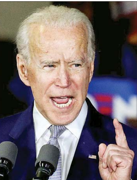
ဒီမိုကရက်တစ်ကိုယ်စားလှယ် ဂျိုးဘိုင်ဒင်