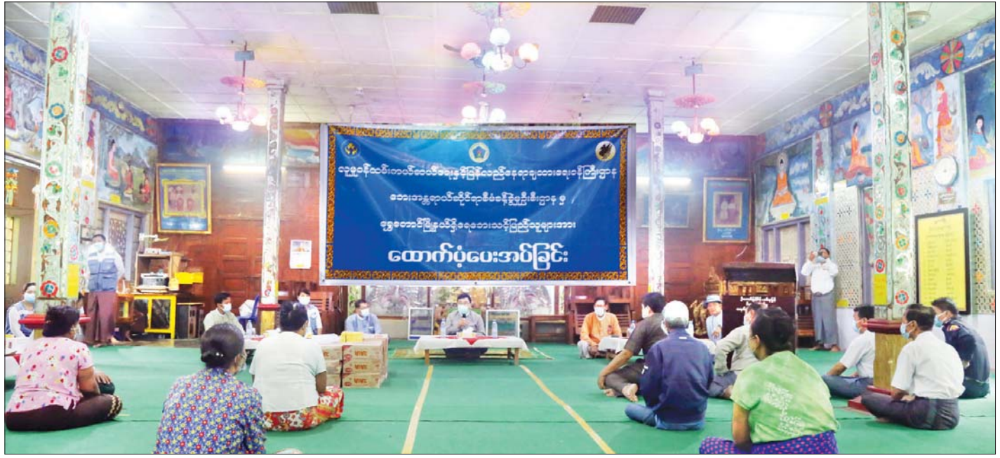
ပြည်ထောင်စုဝန်ကြီး ဒေါက်တာဝင်းမြတ်အေး ပဲခူးတိုင်းဒေသကြီး ရွှေတောင်မြို့နယ်ရှိ သမိုင်းဝင် ရွှေပြောင်ပြောင်စေတီတော်၌ ရေဘေးသင့်ပြည်သူများအား အားပေးစကားပြောကြားစဉ်။ သတင်းစဉ်

ရေဘေးသင့်ပြည်သူများနှင့်တွေ့ဆုံစဉ် ပြည်ထောင်စုဝန်ကြီးက ကမ္ဘာ့ရာသီဥတုပြောင်းလဲမှုကြောင့် ဘေးဒဏ်များကို တစ်ကမ္ဘာလုံးက ရင်ဆိုင်နေရပါကြောင်း၊ မိုးခေါင်ရေရှားခြင်းနှင့်အတူ နေရာကွက်၍ မိုးကြီးခြင်း၊ ရေကြီးရေလျှံဖြစ်ခြင်းစသည့် သဘာဝဘေးဒဏ်များကို ခံစားနေကြရကြောင်း၊ သဘာဝဘေးဒဏ်များအတွက် ကြိုတင်ပြင်ဆင် ကာကွယ်ရေးလုပ်ငန်းများကို အစိုးရအနေဖြင့် အတတ်နိုင်ဆုံး ကြိုးပမ်းဆောင်ရွက်လျက်ရှိကြောင်း၊ အရေးပေါ်တုံ့ပြန်ရေးနှင့် ပြန်လည်ထူထောင်ရေးလုပ်ငန်းများအတွက် ထိရောက်စွာ အသုံးပြုနိုင်ရန် စနစ်တကျ စီမံဆောင်ရွက်နေပါကြောင်း၊ ယခုကြုံတွေ့ရသည့် ရေဘေးသည် အခိုက်အတန့်သာဖြစ်သော်လည်း ကိုဗစ်-၁၉ ကပ်ရောဂါ ဖြစ်ပွားနေခြင်းကြောင့် ပြည်သူများအခက်အခဲများ ရင်ဆိုင်နေရသည်ကို နားလည်ပါကြောင်း၊ ထို့ကြောင့် ပြည်သူများ၏ ဘေးဒုက္ခအခက်အခဲများကို လတ်တလော ပြေလည်စေရန် လာရောက်ပံ့ပိုးကူညီခြင်းဖြစ်ကြောင်း၊ ကိုဗစ်-၁၉ ကပ်ရောဂါနှင့် ပတ်သက်၍ တစ်ကမ္ဘာလုံးအနေဖြင့် စိုးရိမ်ရသည့် အခြေအနေ၌ပင် ရှိသေးကြောင်း၊ မြန်မာနိုင်ငံတွင်လည်း တစ်ဦးချင်းက ကိုဗစ်-၁၉ ဆိုင်ရာ စည်းကမ်းချက်များကို တိတိကျကျ လိုက်နာရန်လိုပါကြောင်း၊ အပြင်ထွက်တိုင်း နှာခေါင်းစည်း တပ်ခြင်း၊ လူစုလူဝေးရှောင်ရှားခြင်း၊ လက်ကိုဆပ်ပြာဖြင့် စက္ကန့် ၂၀ ကြာ စနစ်တကျဆေးကြောခြင်းတို့ကို တစ်ဦးချင်းက တာဝန်ယူ ဆောင်ရွက်ရန်ဖြစ်ကြောင်း၊ မပျံ့ဆက်စေလိုကြောင်း၊ ပြည်သူများက ပူးပေါင်းဆောင်ရွက်ပေးကြစေလိုကြောင်း ပြောကြားသည်။