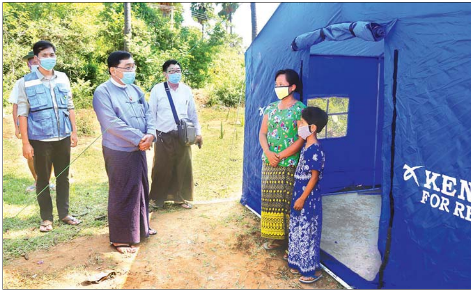
ပြည်သူများထံ ပေးအပ်သည်။

ရှေးဦးစွာ ပြည်ထောင်စုဝန်ကြီးက ညောင်ဦးမြို့ မဟာဝိသုတာရာမကျောင်းတိုက်သို့ ရောက်ရှိပြီး ကျောင်းတိုက် ဘုန်းတော်ကြီးအား ဝါဆိုသင်္ကန်းနှင့် လှူဖွယ်ပစ္စည်းကပ်လှူပူဇော်သည်။ ထို့နောက် ပြည်ထောင်စုဝန်ကြီးနှင့် အဖွဲ့သည် မဟာဝိသုတာရာမကျောင်းတိုက်၊ ဆန်ကုန်းရပ် ရှစ်မျက်နှာကျောင်းတိုက်