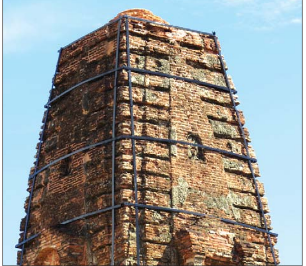
ဆားလည်ဒေသရှိ ပုဂံခေတ်ပုံစံ စေတီတစ်ဆူ