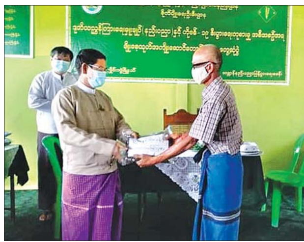
မြို့နယ်(ပြန်/ဆက်)

ထောက်ပံ့ပေးအပ်ပွဲတွင် ဒုတိယညွှန်ကြားရေးမှူးချုပ် (နည်းပညာ) ဦးသက်မောင်က ကိုဗစ် -၁၉ ကာလ စီးပွားရေးကုစားမှုအစီအစဉ်အရ တောင်သူ များအနေဖြင့် စိုက်ပျိုးရေးဆိုင်ရာ ထိခိုက်ဆုံးရှုံးမှုမရှိစေရန် မျိုးစေ့များ ထောက်ပံ့ ပေးအပ်ခြင်းဖြစ်ကြောင်း၊ တောင်သူများအနေဖြင့် စိုက်ပျိုးရေးနှင့် ပတ်သက်ပြီး လိုအပ်သော စိုက်ပျိုးနည်းစနစ်များကို စိုက်ပျိုးရေးဦးစီးဌာနအား ပံ့ပိုးကူညီ ဆောင်ရွက်မည် ဖြစ်ကြောင်း ပြောကြားပြီး မျိုးစေ့များကို တာဝန်ရှိသူများက တောင်သူများထံ ထောက်ပံ့ပေးအပ်သည်။ ထို့နောက် ဒုတိယညွှန်ကြားရေးမှူးချုပ်(နည်းပညာ) ဦးသက်မောင်နှင့် အဖွဲ့က မျိုးစေ့ထုတ်စိုက်ခင်း၊ SRI စနစ်ဖြင့် စိုက်ပျိုးထားရှိမှုကို လှည့်လည် ကြည့်ရှုကာ လိုအပ်သည်များကို မှာကြားခဲ့ကြောင်း သိရသည်။