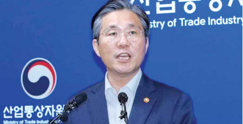
တောင်ကိုရီးယားကုန်သွယ်ရေး၊ စက်မှုနှင့်စွမ်းအင်ဝန်ကြီး ဆန်ယွန်ဂို။

တောင်ကိုရီးယား ကုန်သွယ်ရေးဝန်ကြီးဌာနကလည်း ယင်းအပေါ် ဇူလိုင် ၃၀ ရက်က ကြေညာချက် တစ်စောင်ထုတ်ပြန်လိုက်ပြီး အဆိုပါကြေညာချက်တွင် ဂျပန်နိုင်ငံ၏ ပို့ကုန်ထိန်းချုပ်မှုသည် တစ်ဖက်သတ်ကျပြီး ကမ္ဘာ့ကုန်သွယ်ရေးအဖွဲ့၏ စည်းမျဉ်းများကို ဆန့်ကျင် လုပ်ဆောင်သည့် ကုန်သွယ်ရေးကန့်သတ်တားဆီးမှု ဖြစ်ကြောင်း၊ နောင်လာမည့် လုပ်ငန်းအဆင့်များတွင်