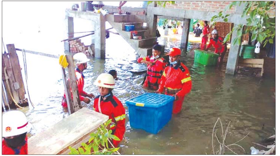
ညောင်ဦးမြို့နယ်တွင် ရေဝင်မှုကြောင့် နေအိမ်များမှ ပြည်သူများအား ဘေးလွတ်ရာ ရွှေ့ပြောင်းပေးစဉ်။

ထိုသို့ပေးအပ်ရာတွင် မြို့နယ်အုပ်ချုပ်ရေးမှူး