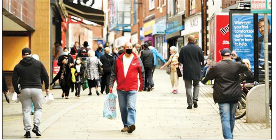
မန်ချက်စတာမြို့တွင် သွားလာလှုပ်ရှားနေသူများကို တွေ့ရစဉ်။