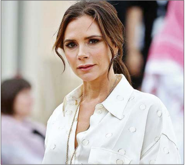
ဗစ်တိုးရီးယားဘက်ခမ်း