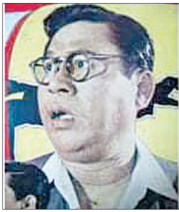
ဖိုးပါကြီး

ကြည်စိုးထွန်း ။ ။ ဟိုဟာတွေ ကျတော့ ခြင်္သေ့ရုပ်တို့၊ ဒေါင်းရုပ် တို့အဲဒါတွေ ပေးတာပေါ့။ ဖလားတို့ ပထမ၊ ဒုတိယ၊ တတိယဆက် ကားကိုပေးတာပေါ့။ အဲဒီဟာကလည်း အစ်မတို့လည်း ရပြီးရော နောက်နှစ်ကျတော့ ကိန္နရာရုပ် ပြောင်းသွား တာနော်။ အဲဒီတော့ ဘာပဲဖြစ်ဖြစ် အစ်မတို့ က ရင်ထိုးတံဆိပ်ရဲ့ နောက်ဆုံး မျိုးဆက်