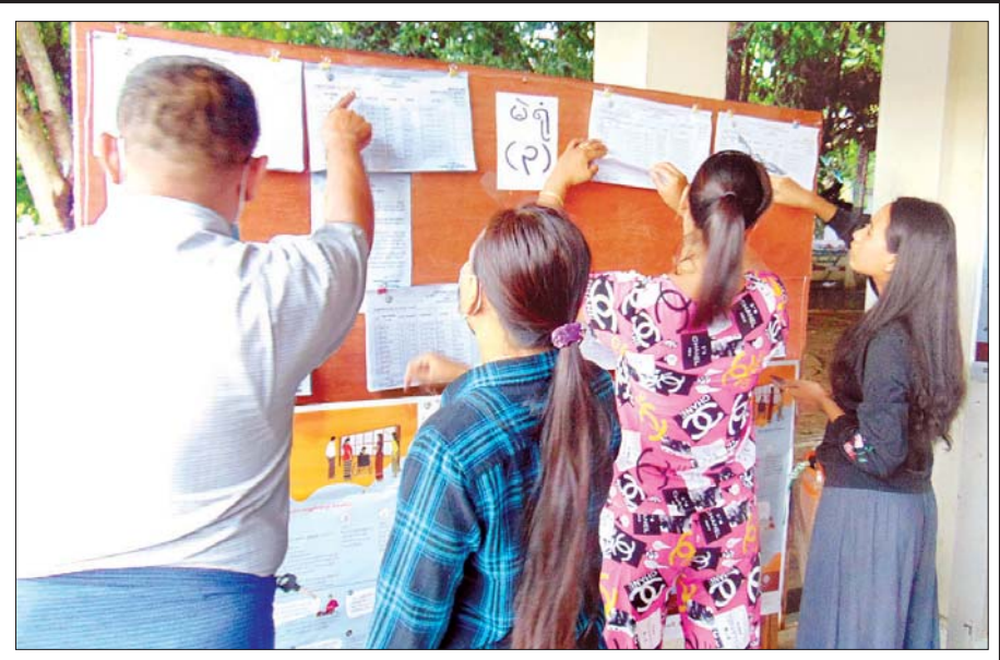
ဧမ္ပူသီရိမြို့နယ်တွင် မဲဆန္ဒရှင်စာရင်းကြေညာထားမှု ကြည့်ရှုနေသူများကို တွေ့ရစဉ်။