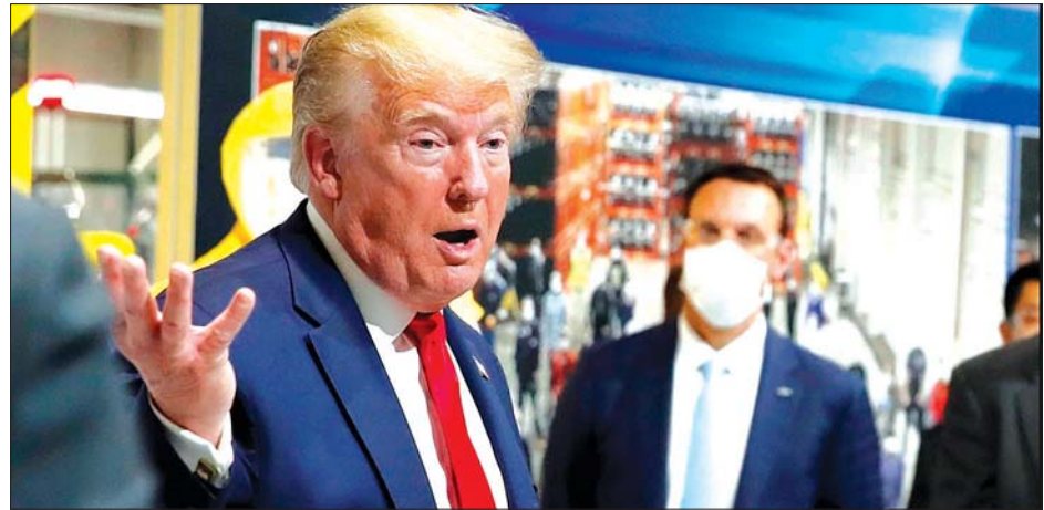
အမေရိကန်သမ္မတ ဒေါ်နယ်ထရမ်။

အမေရိကန်သမ္မတရွေးကောက်ပွဲအစီအစဉ်ကို ရွှေ့ဆိုင်းရန် ဇူလိုင် ၃၀ ရက်က အဆိုပြုခဲ့သည်။