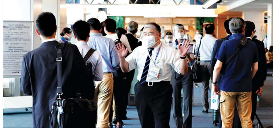
ဂျပန်လူဝင်မှုကြီးကြပ်ရေးက လူဝင်မှုကြီးကြပ်မှုများ ဆောင်ရွက်နေစဉ်။

နှာခေါင်းစည်းတပ်ဆင်ရန် မကြာခင် ငြင်းဆိုလေ့ရှိသည့် ဂိုမတ်သည် ဇူလိုင် ၂၉ ရက် နံနက်ပိုင်းက အမေရိကန်သမ္မတ ဒေါ်နယ်ထရမ်နှင့်အတူ တက္ကဆက်ပြည်နယ် မစ်လန်းမြို့သို့ သွားရောက်ရန်စဉ်ထားခြင်းဖြစ်သော်လည်း အိမ်ဖြူတော်၏ ကြိုတင်စစ်ဆေးမှုတွင် ကိုရိုနာဗိုင်းရပ်စ်စစ်ဆေးတွေ့ရှိခဲ့ခြင်းဖြစ်သည်။ ဆင်ဟွာ