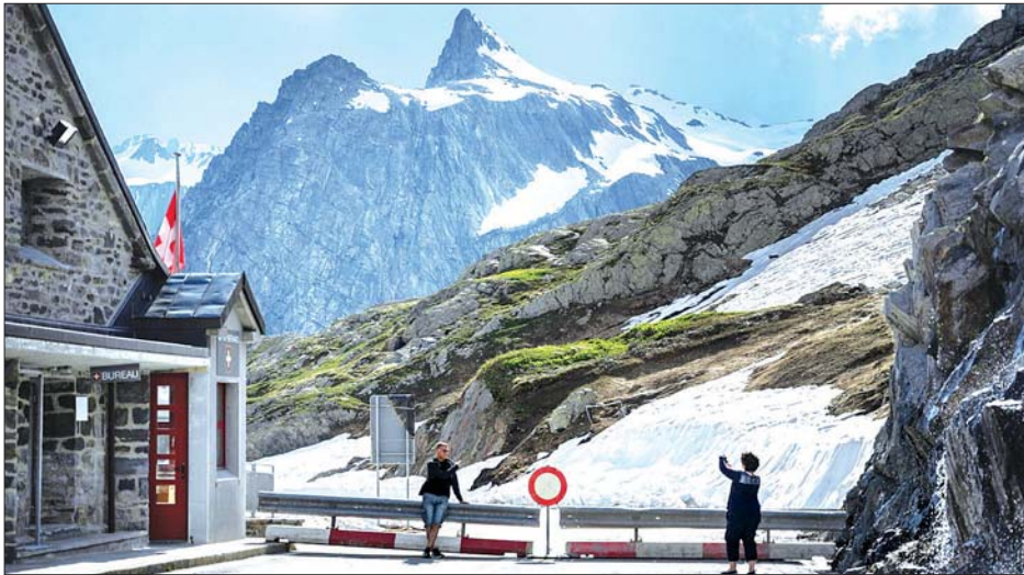
ဆွစ်ဇာလန်နှင့် အီတလီနယ်စပ်တွင် ဓာတ်ပုံရိုက်နေကြသည့် ခရီးသွား နှစ်ဦးကို ဇွန် ၂ ရက်က တွေ့ရစဉ်။

“အခုဆိုရင် ကမ္ဘာ့နိုင်ငံအသီးသီးဟာ ကိုဗစ် -၁၉ ကပ်ရောဂါကို ကြိုကြိုခံပြီး ရင်ဆိုင်နေကြရပါတယ်။ နိုင်ငံတိုင်း နိုင်ငံတိုင်းက အစိုးရအသီးသီးဟာလည်း ကိုဗစ် - ၁၉ နဲ့ပတ်သက်ရင် အဓိကလုပ်ဆောင်စရာ တာဝန်နှစ်ရပ် ရှိနေပါတယ်။ ပထမတစ်ခုကတော့ ပြည်သူ တွေရဲ့ ကျန်းမာရေးအတွက် အထူးဦးစားပေး ကာကွယ် သွားရမှာဖြစ်ပြီး နောက်တစ်ခုကတော့ အလုပ်နေရာတွေ