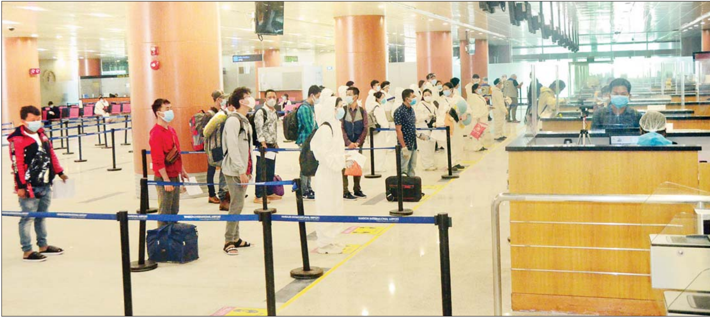
ကမ္ဘောဒီးယားနိုင်ငံမှ ပြန်လည်ရောက်ရှိလာသည့် မြန်မာနိုင်ငံသားများအား တွေ့ရစဉ်။ သတင်းစဉ်

နေပြည်တော် ဇူလိုင် ၃၁ ပြည်ပနိုင်ငံများတွင် အခက်အခဲကြုံတွေ့နေရသည့် မြန်မာနိုင်ငံသားများအား ပြန်လည် ခေါ်ဆောင်ရန် Coronavirus Disease 2019 (COVID-19) ကာကွယ် ထိန်းချုပ် ကုသရေး အမျိုးသားအဆင့် ဗဟိုကော်မတီ၏ လမ်းညွှန်ချက်နှင့်အညီ နိုင်ငံခြားရေး ဝန်ကြီးဌာနအနေဖြင့် သက်ဆိုင်ရာ ဝန်ကြီးဌာနများ၊ မြန်မာသံရုံးများနှင့် ပူးပေါင်းညှိနှိုင်း၍ ဆောင်ရွက်ပေးလျက်ရှိသည်။ ထိုသို့ ဆောင်ရွက်လျက်ရှိရာ ဂျော်ဒန်နိုင်ငံတွင် အကြောင်း အမျိုးမျိုးဖြင့် ရောက်ရှိနေပြီး မြန်မာနိုင်ငံသို့ပြန်ရန် အခက်အခဲကြုံတွေ့နေရသည့် မြန်မာ နိုင်ငံသား ၁၂၁ ဦးအား မြန်မာသံရုံး တံလ်အစိုးမြို့၏ ညှိနှိုင်းဆောင်ရွက်ပေးမှုဖြင့် အပြည်ပြည်ဆိုင်ရာမြန်မာလေကြောင်းလိုင်း (MAI) ကယ်ဆယ်ရေးလေယာဉ်ဖြင့် တတိယ အကြိမ် ပြန်လည်ခေါ်ဆောင်ပေးခဲ့ရာ ယနေ့ နံနက် ၄ နာရီ ၄၅ မိနစ်တွင် ရန်ကုန် အပြည်ပြည်ဆိုင်ရာလေဆိပ်သို့ အဆင်ပြေချောမွေ့စွာ ပြန်လည်ရောက်ရှိကြသည်။ စာမျက်နှာ ၇ ကော်လံ ၂