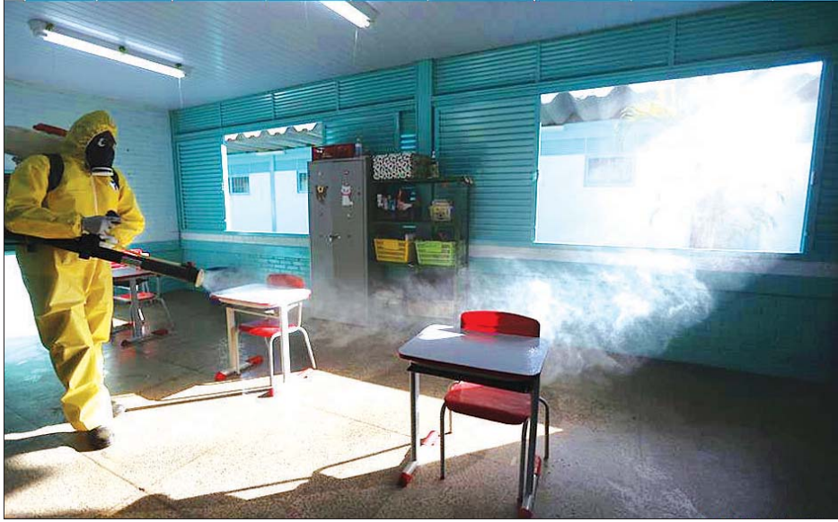
ဘရာဇီးနိုင်ငံ ဘရာဇီးလီးယားရှိ ကျောင်းတစ်ကျောင်းတွင် အလုပ်သမားတစ်ဦး ပိုးသတ်ဆေးဖျန်းနေစဉ်။

ဘရာဇီးနိုင်ငံ၏ လူအထူထပ်ဆုံး အရှေ့တောင်ပိုင်းပြည်နယ် ဆော်ပိုလိုသည် ကိုရိုနာဗိုင်းရပ်စ်ရိုက်ခတ်မှုဒဏ်ကို အဆိုးဆုံးဆုံးခံစားရပြီး ကပ်ရောဂါကူးစက်ခံရသူ ၅၂၉၀၀၆ ဦး ရှိသည့်အနက် ၂၂၇၁၀ သေဆုံးခဲ့သည်။ ရိုယိုဒီဂျနေရိုးသည် ဒုတိယ ကိုရိုနာဗိုင်းရပ်စ် ရိုက်ခတ်မှုဒဏ်ကို အဆိုးဆုံး ခံစားခဲ့ရသောမြို့ဖြစ်ပြီး လူပေါင်း ၁၆၃၆၄၂ ဦး ကူးစက်ခံရကာ သေဆုံးသူ ၁၃၃၄၈ ဦး ရှိခဲ့သည်။ တတိယနေရာတွင် ရှိသောမြို့မှာ စီရာလာဖြစ်ပြီး ဗိုင်းရပ်စ်ကူးစက်ခံရသူ ၇၁၄၄၆ ဦး ရှိကာ သေဆုံးသူ ၇၆၆၁ ဦးရှိကြောင်း သိရသည်။