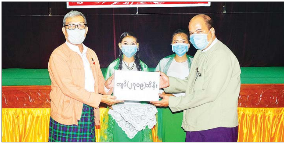
ပြည်နယ်ဝန်ကြီးချုပ် ဦးညီပု က အခြေခံလူတန်းစားများအတွက် ထောက်ပံ့ငွေများကို မြို့နယ်စီခန့်ခွဲမှုကော်မတီဥက္ကဋ္ဌ ဦးကျော်ဆန်းကျော်ထံ လွှဲပြောင်းပေးအပ်စဉ်။

သံတွဲ ဇူလိုင် ၃၁ ရခိုင်ပြည်နယ်ဝန်ကြီးချုပ်ဦးညီပုသည် ပြည်နယ်ဝန်ကြီးများနှင့်အတူ ဇူလိုင် ၃၀ ရက် ညနေပိုင်းက သံတွဲမြို့၊ ဒွါရာဝတီခန်းမ၌ ကျင်းပသည့် ကိုစစ် - ၁၉ ရောဂါ ကာကွယ်၊ ထိန်းချုပ်၊ ကုသခြင်းကာလအတွင်း ပုံမှန်ဝင်ငွေမရှိသော အခြေခံလူတန်းစားများအား ထောက်ပံ့ကြေးပေးအပ်ပွဲနှင့် သံတွဲခရိုင်အတွင်းရှိ လူရည်ချွန်မောင်မယ်များအား ဂုဏ်ပြုချီးမြှင့်ပွဲအခမ်းအနားသို့ တက်ရောက်သည်။ ပြည်နယ်ဝန်ကြီးချုပ်က အဖွင့်အမှာစကားပြောကြားသည်။ ဆက်လက်၍ ပြည်နယ်ဝန်ကြီးချုပ်က ထောက်ပံ့ငွေများကို မြို့နယ်စီခန့်ခွဲမှုကော်မတီဥက္ကဋ္ဌ၊ ဦးကျော်ဆန်းကျော်ထံ လွှဲပြောင်းပေးအပ်ခဲ့ပြီး ပြည်နယ်ဝန်ကြီးများက အိမ်ထောင်စုတစ်စုချင်းအလိုက် ထောက်ပံ့ငွေများကို ပေးအပ်ခဲ့ရာ ပြည်နယ်ဝန်ကြီးချုပ်ကိုယ်စား ပြည်နယ်လူမှုရေးဝန်ကြီး ဒေါက်တာချမ်းသာက နိဂုံးချုပ်အမှာစကားပြောကြားသည်။ ထို့နောက် ၂၀၁၉-၂၀၂၀ ပညာသင်နှစ် သံတွဲခရိုင် လူရည်ချွန်မောင်မယ်များအား ဂုဏ်ပြုချီးမြှင့်ခြင်းကို ကျင်းပရာ ပြည်နယ်ဝန်ကြီးချုပ်က အဖွင့်အမှာစကားပြောကြားသည်။ ယင်းနောက် ပြည်နယ်စည်ပင်သာယာရေးဝန်ကြီးနှင့် လူရည်ချွန်မောင်မယ်များအား ပြည်နယ်လူမှုရေးဝန်ကြီး