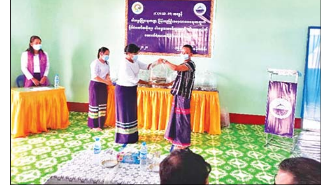
၇၄ ဒသမ ၂၆ ဧကအတွက် ငါးသားပေါက်ကောင်ရေ ၁၄၈၅၂၀ အား ထောက်ပံ့ ပေးအပ်ခဲ့ကြောင်း သိရသည်။ သတင်းစဉ်

အခမ်းအနားသို့ ကရင်ပြည်နယ် ငါးလုပ်ငန်းဦးစီးဌာနမှူး၊ ကျောကရိတ် ခရိုင်/ မြို့နယ်အုပ်ချုပ်ရေးမှူး၊ ခရိုင်/မြို့နယ်အဆင့် ဌာနဆိုင်ရာ တာဝန်ရှိသူ များ၊ ငါးမွေးတောင်သူများ တက်ရောက်သည်။ အခမ်းအနားတွင် ပြည်နယ် ငါးလုပ်ငန်းဦးစီးဌာနမှူး ဒေါ်အေးအေးဇော်က CERP အရ ငါးသားပေါက်ဖြန့်ဖြူး ပေးမှုနှင့်ပတ်သက်၍ ရှင်းလင်းတင်ပြပြီး ကျောကရိတ်ခရိုင်အုပ်ချုပ်ရေးမှူးက အမှာစကားပြောကြားသည်။ ကျောကရိတ်ခရိုင်အတွင်းရှိ ငါးမွေးတောင်သူ ၃၄ ဦး၏ ငါးမွေးကန်