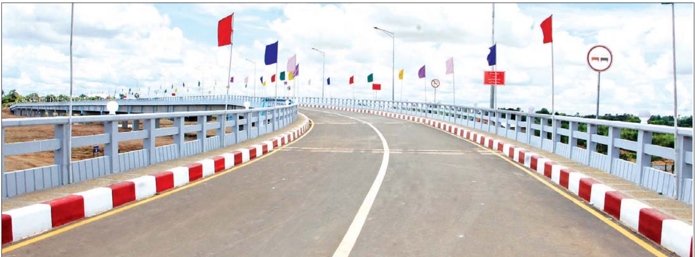
ရွှေကျင်မြို့နယ် တောင်ငူ-ကျောက်ကြီး-ရွှေကျင်-ဝင်းကံ လမ်းပေါ်ရှိ ရွှေကျင်ချောင်းကူးတံတားကို တွေ့ရစဉ်။