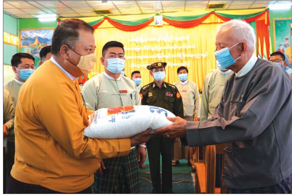
ပြည်နယ်ဝန်ကြီးချုပ် ဒေါက်တာလင်းထွန်း သက်ကြီးအနုပညာရှင်တစ်ဦးအား ထောက်ပံ့ပစ္စည်းများ ပေးအပ်စဉ်။

ဦးကျော်သူဇော်တို့က နောင်မွန် ကျေးရွာမှ လယ်သမားများအတွက် ပုံစံ(၇) ၈၇ ခု၊ ဆုံကွယ်ကျေးရွာအုပ်စု မှ လယ်သမားများအတွက် ပုံစံ(၇) ၁၃ ခု၊ မန်းပွဲကျေးရွာအုပ်စုမှ လယ်သမားများအတွက် ပုံစံ(၇) ၃၃ ခုနှင့် ကုန်းမုံကျေးရွာအုပ်စုမှ လယ်သမားများအတွက် ပုံစံ (၇) ၃၂ ခုတို့ကို ပေးအပ်သည်။