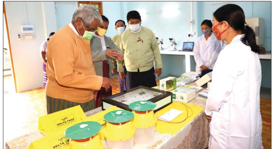
တိုင်းဒေသကြီးဝန်ကြီးချုပ်ဒေါက်တာမြင့်နိုင် စိုက်ပျိုးရေးဓာတ်ခွဲခန်း၌ လုပ်ငန်းများဆောင်ရွက်နေမှုကို ကြည့်ရှုအားပေးစဉ်။