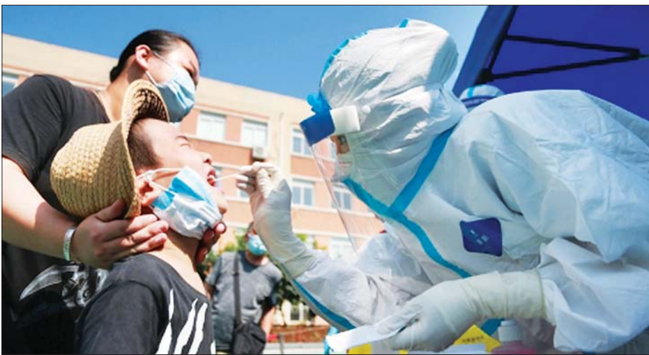
တရုတ်နိုင်ငံ၌ ပြည်သူတစ်ဦးကို ကိုဗစ်-၁၉ ကူးစက်မှု ရှိမရှိ စစ်ဆေးခြင်း ဆောင်ရွက်နေစဉ်။