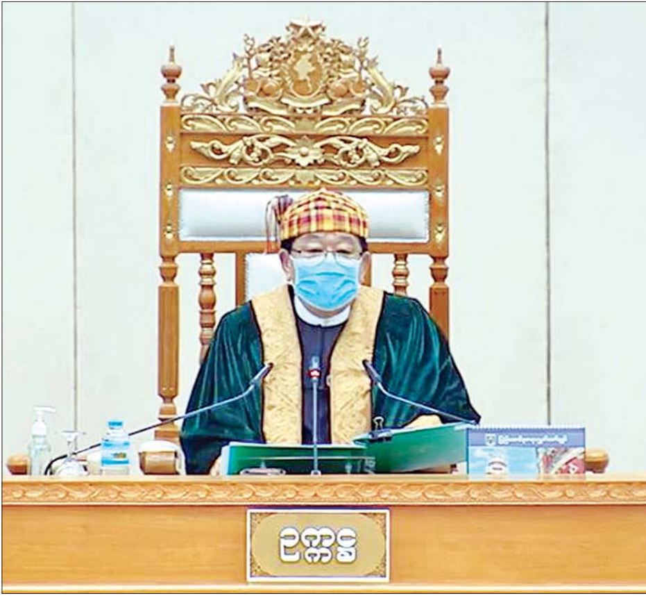
ပြည်သူ့လွှတ်တော်ဥက္ကဋ္ဌ ဦးတီခွန်မြတ်

မြန်မာနိုင်ငံတစ်ဝန်းတွင် ယာဉ်တိုက်မှု၊ ယာဉ်မတော်တဆဖြစ်မှုများကြောင့် သေဆုံးခြင်း၊ ထိခိုက်ဒဏ်ရာရခြင်းများ တဖြည်းဖြည်းမြင့်တက်လာနေပါသောကြောင့် ယာဉ်အန္တရာယ်၊ လမ်းအန္တရာယ်နှင့်ပတ်သက်၍ အသိပညာပေးခြင်း၊ အရေးယူခြင်းများကို ယခုထက်ပို၍ ထိထိရောက်ရောက် အရှိန်မြှင့်ဆောင်ရွက်ပေးရန် အဆိုတင်သွင်း