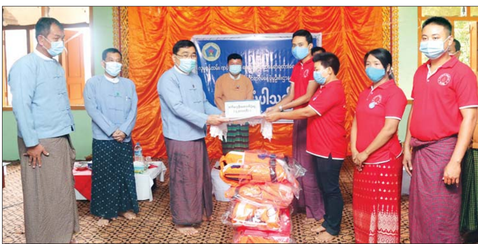
ယင်းနောက် ပြည်ထောင်စုဝန်ကြီးသည် လူမှုဝန်ထမ်း ဦးစီးဌာနက လစဉ်ထောက်ပံ့လျက်ရှိသည့် အသက်(၈၅) နှစ်နှင့်အထက် ဘိုးဘွား ၃၄၅ ဦးအတွက် လူမှုရေးပင်စင် စုစုပေါင်းထောက်ပံ့ ငွေကျပ် ၁၀၃၅၀၀၀၀ ကို ဘိုးဘွားများထံ ပေးအပ်သည်။ မွန်းလွဲပိုင်းတွင် ပြည်ထောင်စုဝန်ကြီးနှင့်အဖွဲ့သည် မင်းကင်းမြို့၌ ဖွင့်လှစ်ရန် ဆောင်ရွက်လျက်ရှိသော ရွှေပြည်တန်ဘိုးဘွားရိပ်သာသို့ ရောက်ရှိပြီး ဘိုးဘွားရိပ်သာ ကော်မတီဝင်များနှင့် တွေ့ဆုံ၍ လူမှုဝန်ထမ်းဦးစီးဌာနက ဆောင်ရွက်ပေးလျက်ရှိသော သက်ကြီးဘိုးဘွားများအား ပြုစုစောင့်ရှောက်ရေးလုပ်ငန်းစဉ်များ၊ ဘိုးဘွားရိပ်သာများ၊ ဂေဟာများနှင့် သင်တန်းကျောင်းများကို သတ်မှတ်ချက် စံနှုန်းများနှင့်အညီ ကူညီထောက်ပံ့ပေးသည့် လုပ်ငန်းစဉ်များ၊ မကြာမီဖွင့်လှစ်မည့် မင်းကင်းမြို့ ရွှေပြည်တန်ဘိုးဘွားရိပ်သာအတွက် ပံ့ပိုးကူညီနိုင်မည့် ကိစ္စရပ်များကို ရှင်းလင်း ဆွေးနွေးပြီး ဘိုးဘွားရိပ်သာ ရန်ပုံငွေအတွက် လတ်တလော ထောက်ပံ့ငွေကျပ် ငါးသိန်းကို တာဝန်ရှိသူများထံ ပေးအပ်သည်။ သတင်းစဉ်

လာရောက်ဆောင်ရွက်ပေးခြင်းဖြစ်ပါကြောင်း၊ ထောက်ပံ့ငွေများသည် ပြည်သူများ၏ အခွန်အခများမှ ရရှိသည့် ပြည်သူ့ဘဏ္ဍာငွေများဖြစ်၍ မိမိတို့တာဝန်ယူ သုံးစွဲခွင့်ရရှိသည့် ငွေများကို ပြည်သူများအကျိုးရှိစေမည့် လုပ်ငန်းများတွင် အလေ့အလွင့်မရှိအောင် ဆောင်ရွက်ပေးလျက် ရှိပါကြောင်း။ ဝန်ကြီးဌာနက တာဝန်ယူ ဆောင်ရွက်ရသည့် ပြည်သူများ တိုက်ရိုက်အကျိုးရှိစေမည့် လုပ်ငန်းစီမံချက်များကို တိုးချဲ့ဖော်ထုတ်ခဲ့ရာ အကောင်အထည်ဖော်မည့် လုပ်ငန်းမဟာများပြားလာသည့်အလျောက် ပြည်သူ့အတွက် ဘတ်ဂျက်များပိုမိုရရှိ ဆောင်ရွက်လျက်ရှိပါကြောင်း၊ လတ်တလော ဘေးဒုက္ခများ လျော့နည်းသက်သာအောင် ဆောင်ရွက်ပေးနေသကဲ့သို့ ရေရှည်အကျိုးမျှော်မှန်း၍လည်း ဆောင်ရွက်ရပါကြောင်း၊ ပြည်သူများကလည်း ပူးပေါင်းဆောင်ရွက်ပေးကြစေလိုကြောင်း ပြောကြားသည်။ ထို့နောက် မင်းကင်းမြို့ရေဘေးသင့်ပြည်သူ ၁၈၅ ဦးအတွက် ဆန်ရိက္ခာဖိုးငွေကျပ် ၃၈၅၅၀၀၊ ခေါက်ဆွဲခြောက်ထုပ်များ၊ ကိုဗစ်-၁၉ ကာကွယ်ရေးအတွက် နှာခေါင်းစည်းများ၊ လက်ဆေးဆပ်ပြာများကို ထောက်ပံ့ပေးအပ်ပြီး ရေဘေးကယ်ဆယ်ရေးလုပ်ငန်းများတွင် အသုံးပြုနိုင်ရန် ငွေကျပ် ၄၂ သိန်း တန်ဖိုးရှိ စက်လှေတစ်စင်းနှင့် အသက်ကယ် အင်္ကျီများကို တာဝန်ရှိသူများထံ ထောက်ပံ့ပေးအပ်သည်။