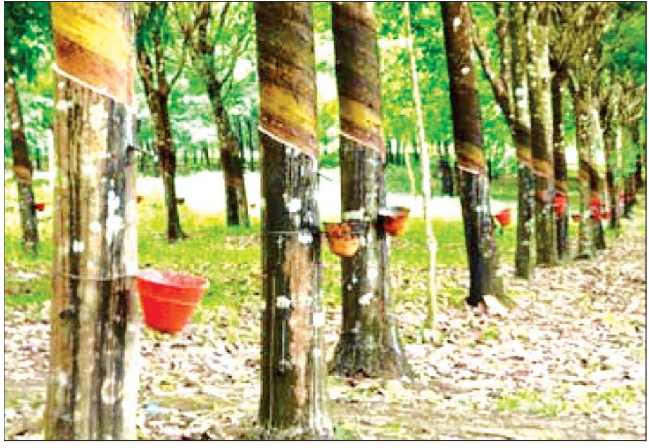
မွန်ပြည်နယ်ရှိ မြန်မာ့သဘာဝရော်ဘာစိုက်ခင်းနှင့် ထုတ်လုပ်နေမှုများ။