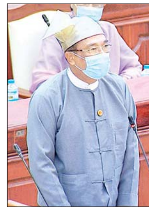
ဒုတိယဝန်ကြီး ဒေါက်တာ ကျော်လင်း