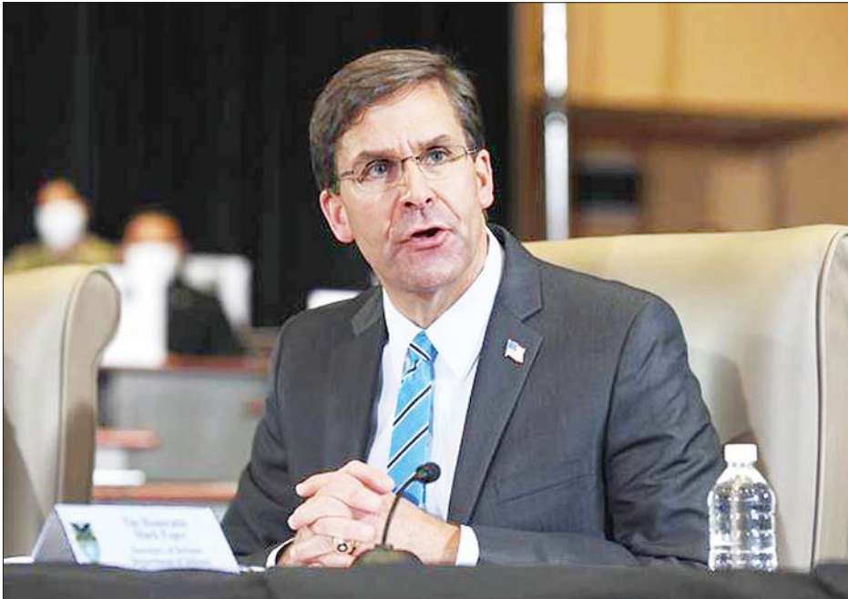
အမေရိကန်ကာကွယ်ရေးဝန်ကြီး မာ့ခ်အက်စ်ပါ