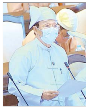
ဒုတိယဝန်ကြီး ဦးလှကျော်