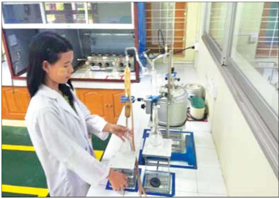
CTQM ရှိ MNRTQL ဓာတ်ခွဲခန်းတွင် မြန်မာ့သဘာဝရော်ဘာ အရည်အသွေးစစ်ဆေးမှု ပြုလုပ်နေစဉ်။

ထို့အပြင် ရော်ဘာကြိတ်ဖတ်များကို အတုံးပြုလုပ်ထားသော Crumb Rubber များကိုလည်း တင်ပို့လျက်ရှိပါသည်။ မြန်မာနိုင်ငံတွင် TSR ရော်ဘာများကို ၁၉၆၉ ခုနှစ် ဝန်းကျင်မှစတင်ထုတ်လုပ်ခဲ့သော်လည်း ပုဂ္ဂလိကပိုင် စက်ရုံများအဖြစ် ၁၉၉၀ ဝန်းကျင်ခန့်မှသာ ပေါ်ပေါက်လာခဲ့ခြင်းဖြစ်သည်။ ထိုသို့ TSR ရော်ဘာများ စတင်ထုတ်