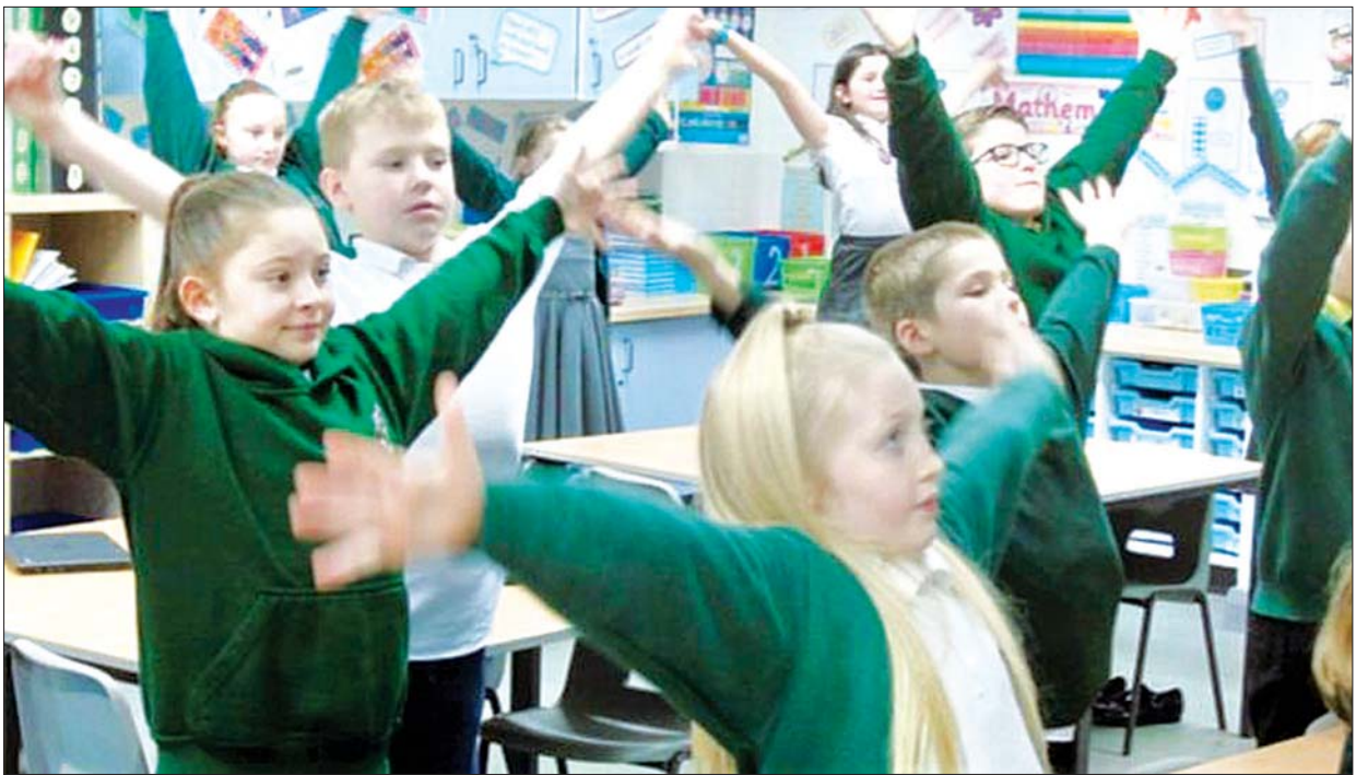
ဝေးလံပြည်နယ်ရှိ မူလတန်းကျောင်းတစ်ခု၌ ကျောင်းသား ကျောင်းသူများ ကိုယ်လက်လှေကျင့်ခန်း ပြုလုပ်နေစဉ်။

စာသင်ကျောင်းက ကျောင်းသားတွေကို စိတ်အခြေအနေဆိုင်ရာ မေးခွန်းလွှာတွေပေးပြီး ဖြေဆိုခိုင်းတဲ့အခါမှာ ထွက်ပေါ်လာတဲ့ရလဒ်တွေက