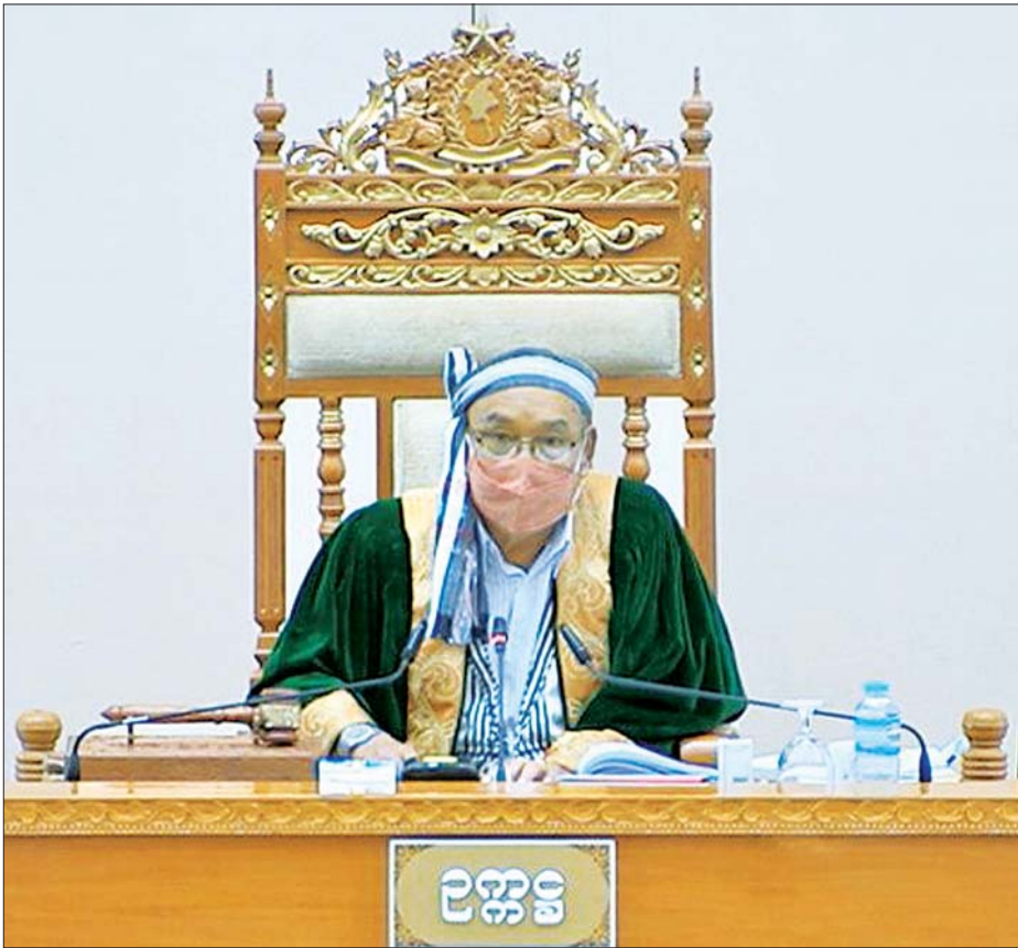
အမျိုးသားလွှတ်တော် ဥက္ကဋ္ဌ မန်းဝင်းခိုင်သန်း

အစိုးရအနေဖြင့် စိန်ခေါ်မှုများကို ရင်ဆိုင်ဖြေရှင်းရာတွင် နိုင်ငံတော်၏အကျိုးနှင့် နိုင်ငံတော်အေးချမ်းတည်ငြိမ်မှုကို မထိခိုက်စေရန် အလေးထား၍ လက်တွေ့ကျကျဖြင့် တရားမျှတစွာ ကိုင်တွယ်ဆောင်ရွက်လျက်ရှိ