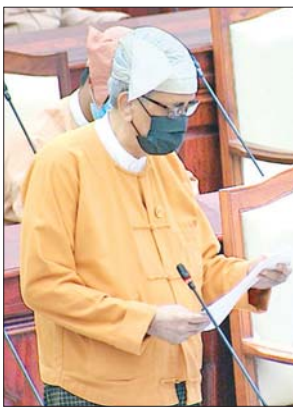
ဒုတိယဝန်ကြီး ဦးကျော်မျိုး

ထို့နောက် စီးပွားရေးနှင့် ကူးသန်းရောင်းဝယ်ရေးဝန်ကြီးဌာနက တင်သွင်း သည့် တိုက်ရိုက်ရောင်းချခြင်း ဥပဒေကြမ်းနှင့်စပ်လျဉ်း၍ ဥပဒေကြမ်းကော်မတီ အတွင်းရေးမှူး ဦးကျော်စိုးလင်း က ဥပဒေကြမ်းကော်မတီ၏ ပြင်ဆင်ရန် တင်ပြချက် အချက် ၅၀ ကို တင်သွင်းပြီး ပြည်သူ့လွှတ်တော်ဥက္ကဋ္ဌ ဦးတင်ဝင်းမြတ် က စီးပွားရေးနှင့် ကူးသန်းရောင်းဝယ်ရေးဝန်ကြီးဌာန၏ သဘောထားမေးမြန်းပြီး လွှတ်တော်၏ သဘောထားရယူအတည်ပြုသည်။