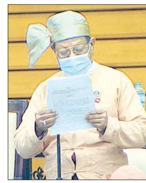
ရန်ကုန်တိုင်းဒေသကြီး မဲဆန္ဒနယ် အမှတ် (၇) မှ ဦးမြင့်စိုး

မီတာဘောက်စစ်များ အမြန်ဆုံးရရှိတပ်ဆင်အသုံးပြုနိုင်ရေး မည်ကဲ့သို့ဆောင်ရွက် ပေးသွားမည်ကို သိရှိလိုခြင်း မေးခွန်းနှင့် စပ်လျဉ်း၍ လျှပ်စစ်နှင့် စွမ်းအင် ဝန်ကြီးဌာန ဒုတိယဝန်ကြီး ဦးခင်မောင်ဝင်းက ဝယ်ယူထားသည့် အိမ်သုံးမီတာ များ အသုတ်လိုက်ရောက်ရှိလာပြီဖြစ်သဖြင့် မီတာစမ်းသပ်ရေးဌာနတွင် စစ်ဆေး ပြီးသည့်နောက်တိုင်းဒေသကြီး ၂၀၂၀ ပြည့်နှစ် ဩဂုတ်လနှင့် စက်တင်ဘာလများ အတွင်း တိုင်းဒေသကြီးနှင့် ပြည်နယ်များကို ဆက်လက်ခွဲဝေပေးသွားမည် ဖြစ်ပါကြောင်းနှင့် အိမ်သုံးမီတာများကိုလည်း ထပ်မံဝယ်ယူရေးအတွက် စီစဉ် ဆောင်ရွက်နေပြီဖြစ်ပါကြောင်း ဖြေကြားသည်။