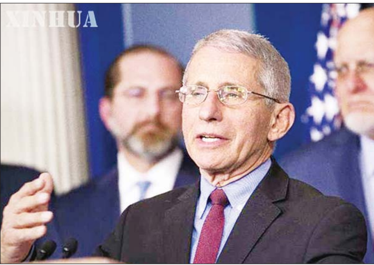
အမေရိကန်နိုင်ငံ ကူးစက်ရောဂါကျွမ်းကျင်ပညာရှင် အန်တိုနီဖော်စီ

ဇူလိုင် ၂၉ ရက်က အမေရိကန်နိုင်ငံတွင် ကိုဗစ်-၁၉ ကြောင့် သေဆုံးသူ ၁၅၀၀၀၀ ကျော်လွန်လာပြီးနောက် ယခုကဲ့သို့ ဖော်စီ၏ သတိပေးချက်ထွက်ပေါ်လာခြင်းဖြစ်သည်။