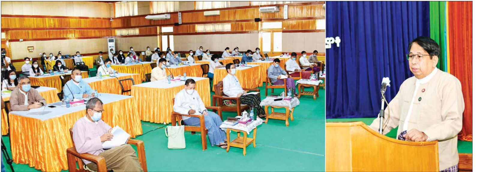
ပြည်ထောင်စုဝန်ကြီး ဒေါက်တာဖေမြင့် မြန်မာ့မီဒီယာအရွှေ့အပေါ် သုံးသပ်ဆွေးနွေးခြင်း အခမ်းအနားတွင် အမှာစကားပြောကြားစဉ်။