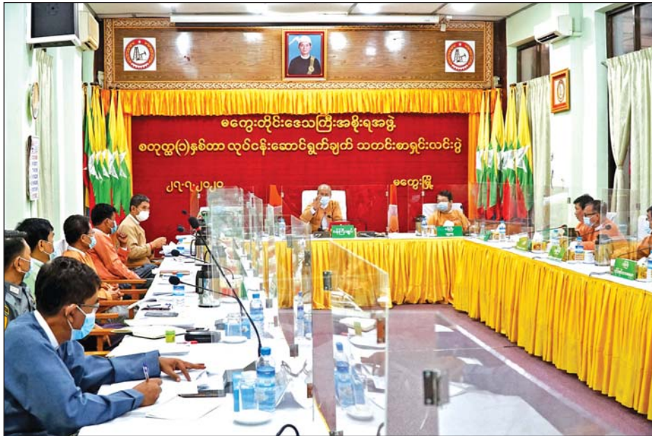
မကွေးတိုင်းဒေသကြီးအစိုးရ၏ တစ်နှစ်တာဆောင်ရွက်ချက် သတင်းစာရှင်းလင်းပွဲပြုလုပ်စဉ်။

မကွေး ဇူလိုင် ၃၀ မကွေးတိုင်းဒေသကြီး အစိုးရအဖွဲ့၏ စတုတ္ထတစ်နှစ်တာ လုပ်ငန်းဆောင်ရွက်ချက်များ သတင်းစာရှင်းလင်းပွဲကို ယမန်နေ့က တိုင်းဒေသကြီးအစိုးရအဖွဲ့ရုံး အောက်ထပ်အစည်းအဝေးခန်းမ၌ ကျင်းပရာ တိုင်းဒေသကြီးဝန်ကြီးချုပ်နှင့် ဝန်ကြီးများ တိုင်းဒေသကြီး အဆင့်ဌာနဆိုင်ရာများနှင့် သတင်းမီဒီယာများ တက်ရောက်သည်။ တိုင်းဒေသကြီး ဝန်ကြီးချုပ် ဒေါက်တာအောင်မိုးညိုက မကွေးတိုင်းဒေသကြီးအတွင်း စတုတ္ထတစ်နှစ်တာ အပါအဝင် လေးနှစ်တာကာလအတွင်း လမ်းပန်းဆက်သွယ်ရေး၊ ပညာရေး၊ ကျန်းမာရေး၊ စိုက်ပျိုးရေး၊ မွေးမြူရေး၊ လျှပ်စစ်မီးလင်းရေး စသည့် ပြည်သူ့အကျိုးပြု ဖွံ့ဖြိုးရေးလုပ်ငန်းများကို ဘက်စုံအချိုးညီစွာ အကောင်အထည် ဖော်ဆောင်မှုများနှင့် မြို့ပြမှသည် ကျေးရွာများအထိ ဖွံ့ဖြိုးတိုးတက်လာစေရန် ကြိုးပမ်းဆောင်ရွက်ခဲ့မှုများနှင့် ပတ်သက်၍ အမှာစကားပြောကြားသည်။ ထို့နောက် တိုင်းဒေသကြီးအစိုးရအဖွဲ့ဝင်ဝန်ကြီးများက စတုတ္ထတစ်နှစ်တာ ကာလအတွင်း ဌာနများ၏