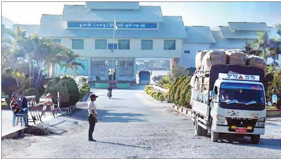
မူဆယ်မြို့ (၁၀၅) မိုင် ကုန်သွယ်ရေးစုစု။