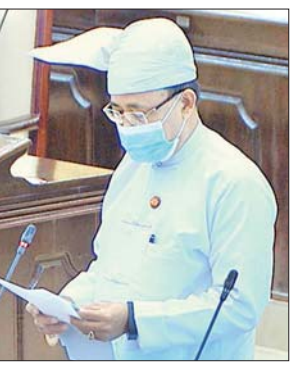
ပြည်ထောင်စုဝန်ကြီး ဦးကျော်တင်

စစ်ကိုင်းတိုင်းဒေသကြီး မဲဆန္ဒနယ်အမှတ်(၈)မှ ဦးကိုကိုနိုင်၏ နိုင်ငံတော် အတွင်း မဟာဓာတ်အားလိုင်း သွယ်တန်းရောက်ရှိပြီးဖြစ်သည့် ကျေးရွာများ တွင် ကျေးရွာအတွင်း 0.4(400) ဗို့အားလိုင်းများ သွယ်တန်းတပ်ဆင်ပြီးစီးပါက