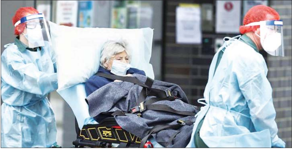
ကျန်းမာရေးဝန်ထမ်းများက ကိုဗစ်-၁၉ လူနာတစ်ဦးကို ရွှေ့ပြောင်းနေစဉ်။

ဗစ်တိုးရီးယားအာဏာပိုင်များက ဒေသပြည်သူများအား ဗိုင်းရပ်စ်စစ်ဆေးမှုကို အမြန်ဆုံးခံယူကြရန် တိုက်တွန်းနှိုးဆော်မှုများ ထပ်မံပြုလုပ်ခဲ့သည်။ ပြီးခဲ့သည့် ရက်သတ္တပတ်က ပြည်နယ်အတွင်း ကိုဗစ်-၁၉ လူနာအချို့သည် တစ်ဦးနှင့်တစ်ဦး ခပ်ခွာခွာနေရန်ညွှန်ကြားချက်ကို ဖောက်ဖျက်ခဲ့မှုများနှင့် ဗိုင်းရပ်စ်စစ်ဆေးမှုကို အချိန်မီ မဆောင်ရွက်ခဲ့မှုများရှိကြောင်း ဗစ်တိုးရီးယားအုပ်ချုပ်ရေးအဖွဲ့က ပြောကြားခဲ့သည်။ မိမိထံတွင် ရောဂါလက္ခဏာတစ်ခုခုပြလာသည်နှင့် တစ်ပြိုင်နက် လုပ်ဆောင်နိုင်သည့်အရာမှာ ဗိုင်းရပ်စ်စစ်ဆေးမှုခံယူရန်ဖြစ်ပြီး လုပ်ငန်းခွင်သို့ မသွားရန်ပင်ဖြစ်ကြောင်း၊ ယင်းအချိန်တွင် သင်လုပ်ဆောင်သမျှ အရာတိုင်းသည် ဗိုင်းရပ်စ်ဖြန့်ဝေနေခြင်း ဖြစ်လာတော့မည်ဖြစ်ကြောင်း ဗစ်တိုးရီးယားပြည်နယ်အုပ်ချုပ်ရေးမှူး ဒန်နီရယ် အန်ဒရူးစ်က ပြောကြားခဲ့သည်။ အေအက်ဖ်ပီ