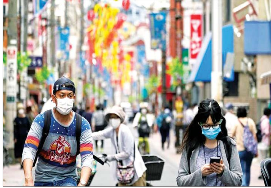
ဂျပန်နိုင်ငံ တိုကျိုမြို့တစ်နေရာတွင် ပြည်သူများ ပါးစပ်နှာခေါင်းစည်းတပ်ဆင်ပြီး သွားလာနေကြစဉ်။