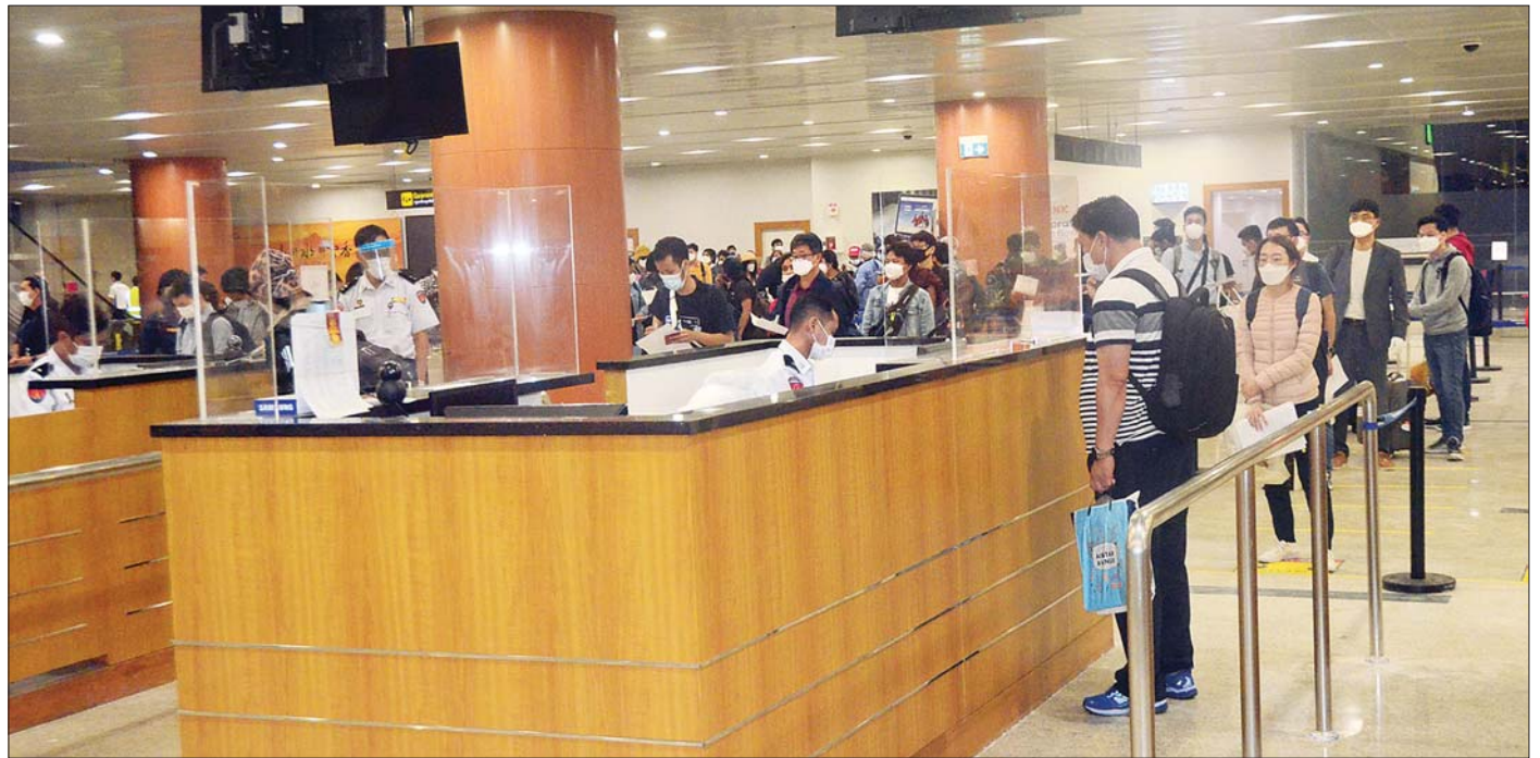
ပြည်ပနိုင်ငံများမှ ပြန်လည်ရောက်ရှိလာသည့် မြန်မာနိုင်ငံသားများကို ရန်ကုန်အပြည်ပြည်ဆိုင်ရာလေဆိပ်၌ တွေ့ရစဉ်။

နေပြည်တော် ဇူလိုင် ၂၈ နိုင်ငံတကာခရီးသည်တင် လေယာဉ်များ ပျံသန်းမှုယာယီ ရပ်ဆိုင်းထားခြင်းကြောင့် ပြည်ပနိုင်ငံများ၌ အခက်အခဲ ကြုံတွေ့နေရသည့် ကိုရီးယားသမ္မတနိုင်ငံမှ မြန်မာနိုင်ငံသား ၃၇ ဦးနှင့် အမေရိကန်ပြည်ထောင်စု၊ အီဂျစ်နိုင်ငံ၊ ကနေဒါ နိုင်ငံ၊ အင်ဒိုနီးရှားနိုင်ငံ၊ ဘယ်လ်ဂျီယံနိုင်ငံ၊ အီတလီနိုင်ငံ၊ ဟန်ဂေရီနိုင်ငံ၊ ဆိုက်ပရပ်စ်နိုင်ငံ၊ ဂျပန်နိုင်ငံ၊ ဂျာမနီနိုင်ငံ တို့မှ မြန်မာနိုင်ငံသား ၇၇ ဦး စုစုပေါင်း ၁၁၄ ဦးတို့အား အင်ဒိုနီးရှားပြည်ပြည်ဆိုင်ရာလေဆိပ်မှတစ်ဆင့် (၁၅)ကြိမ် မြောက် ကိုရီးယားလေကြောင်းလိုင်း ကယ်ဆယ်ရေး လေယာဉ်ဖြင့် ပြန်လည်ခေါ်ဆောင်ခဲ့ရာ ယနေ့ညပိုင်း တွင် ရန်ကုန်အပြည်ပြည်ဆိုင်ရာလေဆိပ်သို့ အဆင်ပြေ ချောမွေ့စွာ ပြန်လည်ရောက်ရှိကြသည်။ ၎င်းတို့ ရန်ကုန်အပြည်ပြည်ဆိုင်ရာ လေဆိပ်သို့ ရောက်ရှိချိန်တွင် လူဝင်မှုကြီးကြပ်ရေး၊ ကျန်းမာရေးစိစစ် ရေးနှင့် ၂၁ ရက်တာ အသွားအလာ ကန့်သတ်ရေးထိုင်ရေး တို့ကို အလုပ်သမား၊ လူဝင်မှုကြီးကြပ်ရေးနှင့်ပြည်သူ့ အင်အားဝန်ကြီးဌာန၊ ကျန်းမာရေးနှင့်အားကစားဝန်ကြီး ဌာနနှင့် ရန်ကုန်တိုင်းဒေသကြီးအစိုးရအဖွဲ့တို့မှ သက်ဆိုင်ရာ အခန်းကဏ္ဍအလိုက် တာဝန်ယူဆောင်ရွက်ပေးခဲ့သည်။ စာမျက်နှာ ၁၆ ကော်လံ ၄ *