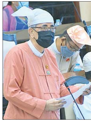
ပို့ဆောင်ရေးနှင့် ဆက်သွယ်ရေး ဝန်ကြီးဌာန ဒုတိယဝန်ကြီး ဦးကျော်မျိုး