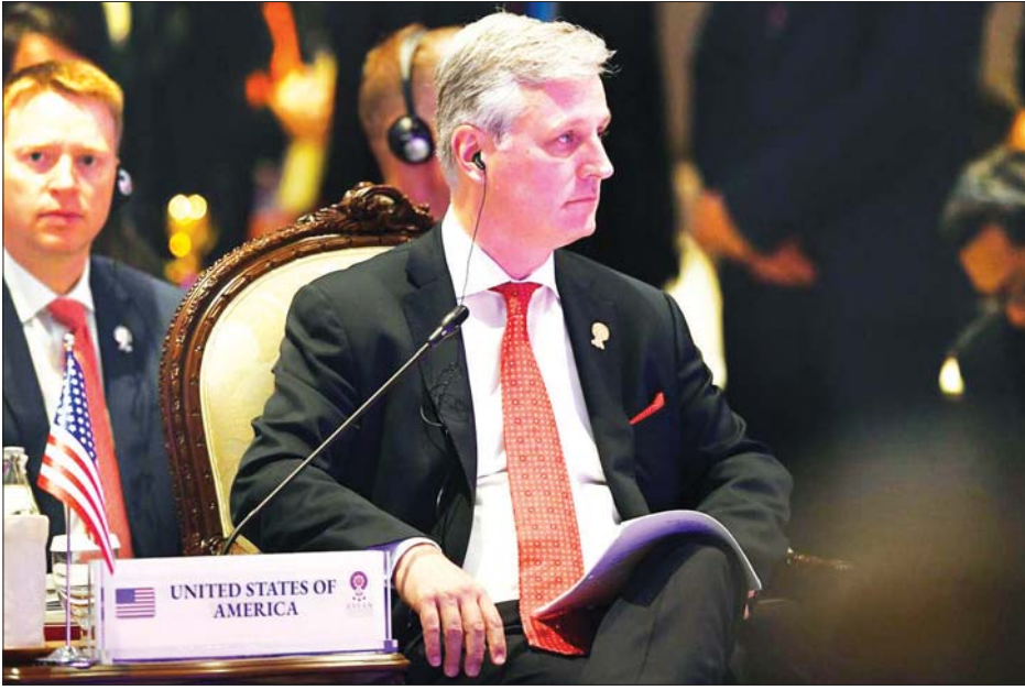
အမျိုးသားလုံခြုံရေးဆိုင်ရာ အကြံပေး ရောဘတ်အိုဘိုင်ယန်။