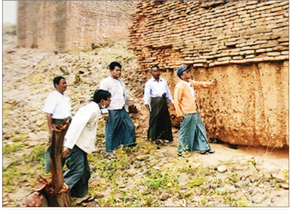
မြေသားဖြင့် တည်ဆောက်ခဲ့သော ပုခန်းကြီးမြို့ရိုးနှင့်ကျုံးကို မူရင်းနီးပါးထိ မြင်တွေ့ရစဉ်။

ပုဂံနိုင်ငံတော်ကြီးကို အေဒီ ၁၀၇ ခုနှစ်တွင် သရေခေတ္တရာရာမရောက်လာသော ပျူများက စတင်တည်ထောင်လိုက်ကြသည်။ ရွာပေါင်း ၁၉ ရွာ စည်းဝေးပြီးခေါင်းဆောင်မည့်သူကို သမ္မုဒ္ဓရာဇ်(ရာဇာမင်းဟု သမုတ်လိုက်ကြသည်) ဟု ရှင်ဘုရင်ခန့်လိုက်သည်။ မင်းဆက်ပေါင်း ၅၅ ဆက်၊ နှစ်ပေါင်း ၁၂၆၂ နှစ်သက်တမ်း ကြာမြင့်ခဲ့သည်။ ပုဂံပျက်သောအခါရမ်းညီနောင်သုံးယောက်တို့သည် ကျောက်ဆည်နယ်ဘက်ကို အခြေပြု၍ တစ်ရှင်သီဟသူသည် အေဒီ-၁၃၁၂ ခုနှစ်တွင် ပင်းယမြို့ကို တည်သည်။ ပင်းယမင်းဆက်တွင် မင်း ၆ ဆက် အုပ်ချုပ်ပြီး နှစ်ပေါင်း ၅၀ ကျော်ကြာခဲ့သည်။ ပင်းယဆိုသည်မှာ ယခုမန္တလေးလေဆိပ်ကြီး နေရာ ဖြစ်သည်။ တစ်ရှင်သီဟသူသည် လက်မည်း အမတ်ကြီးကို ပုခန်းကြီးအမတ်ကြီးခန့်၏ စစ်သား ၄၀၀ နှင့် ပုခန်းကို စေလွှတ်သည်။ လက်မည်းအမတ်ကြီးသည် ယခင်စည်သူနှင့် ကျော်စွာ