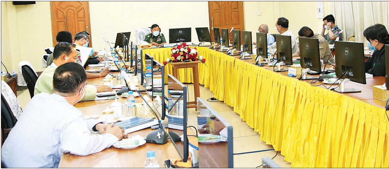
ငွေကြေးခဝါချမှုတိုက်ဖျက်ရေးဗဟိုအဖွဲ့ ဥက္ကဋ္ဌ၊ ပြည်ထောင်စုဝန်ကြီးဌာန ပြည်ထောင်စုဝန်ကြီး ဒုတိယဗိုလ်ချုပ်ကြီး စိုးထွဋ် ငွေကြေးခဝါချမှု တိုက်ဖျက်ရေးဗဟိုအဖွဲ့ အစည်းအဝေး (၁/၂၀၂၀) တွင် အမှာစကားပြောကြားစဉ်။

နေပြည်တော် ဇူလိုင် ၂၈ ငွေကြေးခဝါချမှု တိုက်ဖျက်ရေးဗဟိုအဖွဲ့ အစည်းအဝေး (၁/၂၀၂၀) ကို ယနေ့ မွန်းလွဲ ၂ နာရီတွင် နေပြည်တော်ရှိ ပြည်ထောင်စုဝန်ကြီးဌာန ရုံးအမှတ် (၃၈) အစည်းအဝေးခန်းမ၌ ကျင်းပသည်။