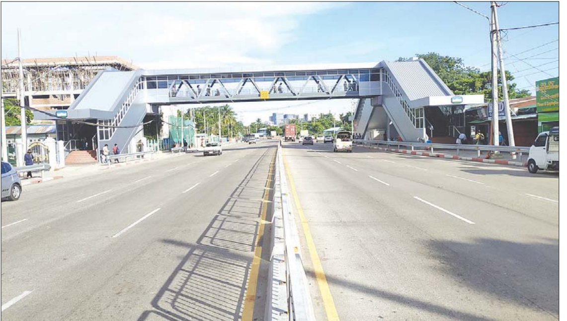
ယမုံနာလမ်းဆုံ လူကူးခုံးကျော်တံတား (ဒေါင်မြို့နယ်)

စတည်ဆောက်စဉ်တုန်းက အခုလို စတုဂံ ပတ်လည်တံတားမျိုးမဟုတ်ပါဘူး။ တစ်စင်း တည်း တစ်ကြောင်းထိုးသာ တည်ဆောက်ခဲ့ ခြင်းဖြစ်တာကို ပြန်ပြောင်းမြင်မိခဲ့သလို စတည်ဆောက်စဉ်က အဆင်းအတက်အတွက် လှေကားနှစ်ခုသာရှိခဲ့ပါတယ်။ အုတ်လှေကား က ကျဉ်းတော့ခရီးသည်တွေ အဆင်းအတက် ကျပ်နေလို့ နောက်ထပ်လှေကားတစ်ခု ထပ်မံ ဖြည့်ဆည်းခဲ့တာကိုလည်း ပြန်အမှတ်ရနေမိပါ တယ်။ အဲဒီတုန်းကတော့ ခြေကျင်သွားခရီး သည်များနဲ့ မော်တော်ယာဉ်များက အလွန် မများခဲ့သေးပါဘူး။ ပတ်လည်တံတားဖြစ် အောင် ၂၀၁၆ ခုနှစ်ကျမှ မြို့တော်စည်ပင် လမ်းတံတားဌာနက ဖြည့်စွက်တည်ဆောက် ခဲ့တာ ဖြစ်ပါတယ်။ ဒါပေမယ့် အခုအခါမှာတော့ ရန်ကုန် မြို့ကြီးရဲ့ လမ်းတွေပေါ်မှာ ခရီးတိုခြေလျင် လျှောက်လှမ်းနေတဲ့ ခရီးသည်တွေက နေ့စဉ် မိုးလင်းကမိုးချုပ်အထိ သွားလာလှုပ်ရှားနေ ကြပါတယ်။