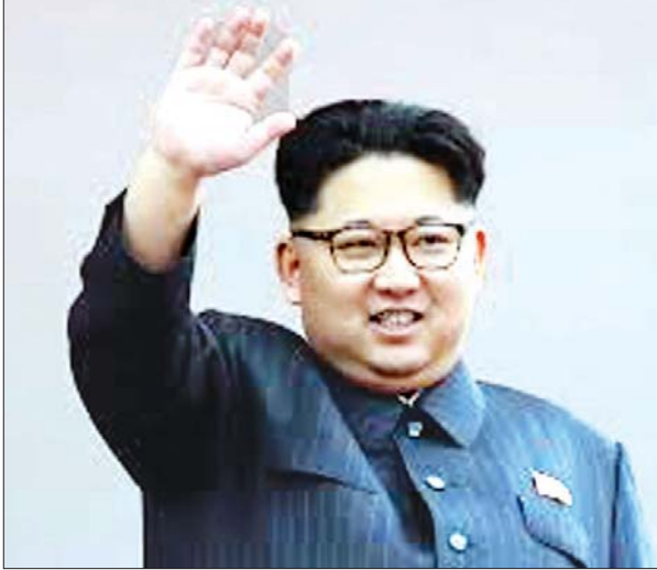
မြောက်ကိုရီးယားခေါင်းဆောင် ကင်ဂျုံအန်း

ပြီယမ်း ဇူလိုင် ၂၈ မြောက်ကိုရီးယား ခေါင်းဆောင် ကင်ဂျုံအန်းက နျူကလီးယား လက်နက်ကို ပိုင်ဆိုင်ခြင်းအားဖြင့် နိုင်ငံ၏လုံခြုံရေးကို အမြဲအာမခံချက် ပေးနိုင်ကြောင်း ပြောကြားလိုက်သည်။ ကင်ဂျုံအန်းက နျူကလီးယား ဇူလိုင် ၂၈ ရက်ထုတ် မြောက် လက်နက်ကို ပိုင်ဆိုင်ခြင်းအားဖြင့် ကိုရီးယားအာဏာပိုင်တို့ သတင်းစာ ဖြစ်သည့် ရိုဒေါင်းဆင်မန်က မြောက် ကိုရီးယားခေါင်းဆောင် ကင်ဂျုံအန်း ကိုရီးယား စစ်ရပ်စဲရေးကာလ သဘောတူညီမှု နှစ်ပတ်လည်နေ့ ဖြစ်သည့် ဇူလိုင် ၂၇ ရက်က စစ်မှုထမ်း ဟောင်း အစည်းအဝေးတွင် မိန့်ခွန်း ပြောကြားခဲ့ကြောင်း ဖော်ပြခဲ့သည်။ မြောက်ကိုရီးယားက အဆိုပါနေ့ အားအမေရိကန်ကို အောင်မြင်ခဲ့သည့် နေ့အဖြစ် ခေါ်ဝေါ်ခဲ့သည်။ မြောက် ကိုရီးယားခေါင်းဆောင် ကင်ဂျုံအန်း နျူကလီးယားလက်နက်ကို ပိုင်ဆိုင် ရန် ကြိုးစားနေကြောင်း၊ နျူကလီး ယားလက်နက် ပိုင်ဆိုင်ခြင်းကသာ လက်နက်ကိုင်ပဋိပက္ခကို တွန်းလှန် နိုင်မည့် ခုန်အားဖြစ်ကြောင်း သတင်း ဖော်ပြချက်အရ သိရသည်။ မြောက်ကိုရီးယား နိုင်ငံသည် ရန်လိုသောအဖွဲ့များ၏ မည်သည့် စစ်ရေးဆိုင်ရာ ခြိမ်းခြောက်မှုမျိုးမဆို ကာကွယ်နိုင်စွမ်းရှိကြောင်း ကင်က