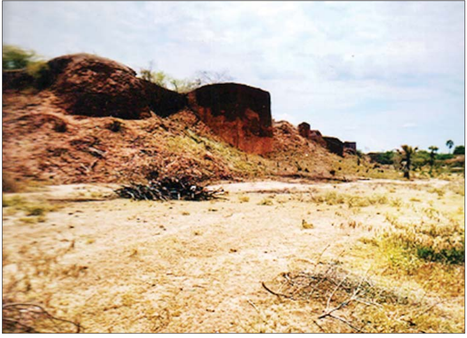
ပုခန်းကြီးမြို့ရိုးနှင့်ကျုံးကို လှမ်းမြင်ရစဉ်။