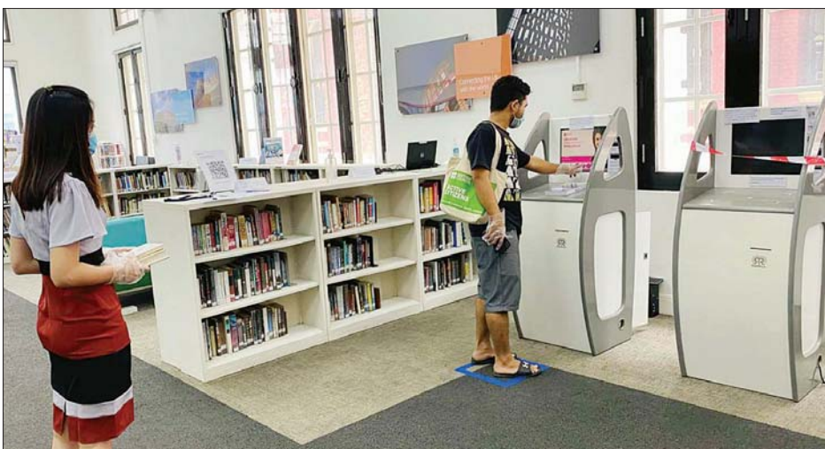
ရန်ကုန်မြို့ရှိ ဗြိတိသျှကောင်စီစာကြည့်တိုက်သို့ ကိုဗစ် - ၁၉ ကျန်းမာရေးလိုက်နာမှုဖြင့် ပြန်လည်ဖွင့်လှစ်ခြင်းပုံရိပ်

ရန်ကုန် ဇူလိုင် ၂၈ ကိုဗစ် - ၁၉ ရောဂါကြောင့် ပိတ်ထားခဲ့သော ရန်ကုန်မြို့နှင့် မန္တလေးမြို့တို့ရှိ ဗြိတိသျှကောင်စီစာကြည့်တိုက်နှစ်ခုကို လက်ရှိတွင် ပြန်လည်ဖွင့်လှစ်ရာ၌ စာကြည့်တိုက်အတွင်းသို့ အပူချိန် တိုင်းခြင်း၊ နှာခေါင်းစည်းတပ်ဆင်ခြင်းနှင့် လက်အိတ်တပ်ဆင်ခြင်းတို့ ပြုလုပ်ပြီးမှ ဝင်ရောက်ခွင့်ပြုကြောင်း သိရသည်။ စာကြည့်တိုက်တွင် လာရောက်အသုံးပြုမည့်ရက်နှင့် အချိန်ကိုလည်း ကြိုတင်ရက်ချိန်း ယူရမည်ဖြစ်ကြောင်း၊ စာကြည့်တိုက်အတွင်း တစ်ကြိမ်ဝင်ရောက်ရန် အသင်းဝင် ဦးရေကို ကန့်သတ်ထားပြီး စာကြည့်တိုက်အတွင်း အသုံးပြုမည့်အချိန်ကိုလည်း ကန့်သတ်ထားကြောင်း၊ လာရောက်သူများအနေဖြင့် ခရီးသွားရာဇဝင်ရှိ မရှိအသွားအလာကန့်သတ်ခံထားရမှု ရှိ မရှိနှင့် အခြားသော ကျန်းမာရေးဆိုင်ရာတို့ကို ပုံစံစာရွက်တွင် ဖြည့်ပြီးမှသာ ဝင်ရောက်ခွင့်ပြုမည်ဖြစ်ကြောင်း ရန်ကုန်မြို့ ဗြိတိသျှ