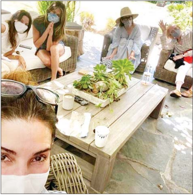
ရုပ်ရှင်မင်းသမီးဆန်ဒရာဘူးလာ့ခ် မွေးနေ့ပွဲပါတီ ကျင်းပနေစဉ် ။