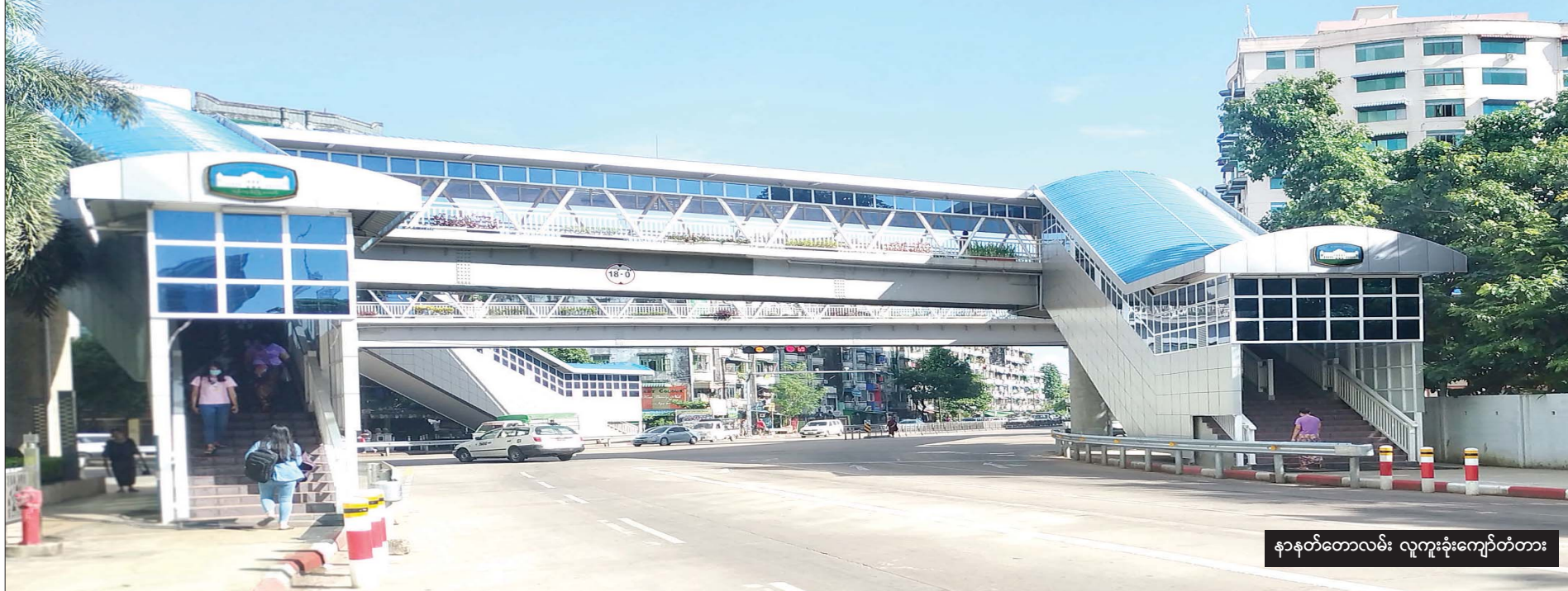
နာနတ်တောလမ်း လူကူးခွဲကျော်တံတား

အဲဒါကြောင့် မြေကျင်သွားခရီးသည်တွေအားလုံး လမ်းကူးရင် လူကူးခွဲကျော်တံတားများအပေါ်ကသာ ဖြတ်သန်းကြပါစို့။ ။