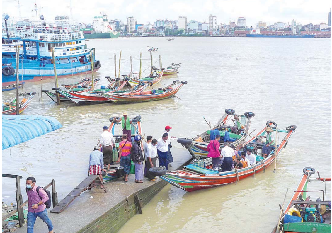
ကမာကသွယ် ကူးတို့ဆိပ်၌ ခရီးသည်များ သွားလာနေမှုကို တွေ့ရစဉ်။