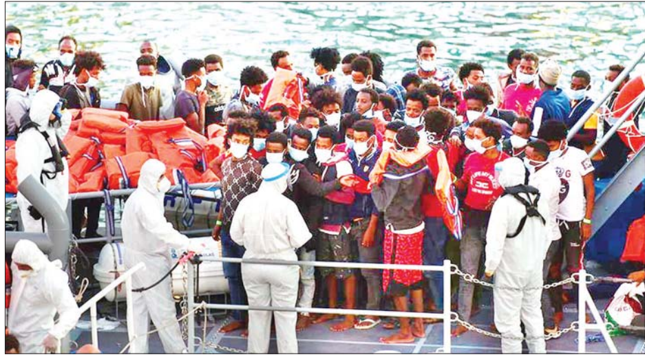
သင်္ဘောပေါ်မှဆင်းရန် စောင့်ဆိုင်းနေကြသည့် ရွှေ့ပြောင်းနေထိုင်သူများကို တွေ့ရစဉ်။

ဗလက်ဒါ ဇူလိုင် ၂၇ မော်လ်တာ လက်နက်ကိုင်တပ်ဖွဲ့၏ ကယ်တင်ခြင်းခံရသည့် ရွှေ့ပြောင်း နေထိုင်သူ ၉၄ ဦးသည် ဇူလိုင် ၂၇ ရက် ညနေပိုင်းက မော်လ်တာနိုင်ငံသို့ ရောက်ရှိသွားပြီဟု ဒေသတွင်း မီဒီယာများတွင် ဖော်ပြထားသည်။ ရွှေ့ပြောင်းနေထိုင်သူအုပ်စုတွင် အများစုမှာ အမျိုးသားများဖြစ်ပြီး အမျိုးသမီးငါးဦး ပါဝင်သည်။ ၎င်းတို့ အားလုံးမှာ မည်သည့်နိုင်ငံသားများ ဖြစ်သည်ကိုမူ မသိရသေးပေ။ အဆိုပါ ရွှေ့ပြောင်း နေထိုင်သူများသည် သီတင်းတစ်ပတ်ကျော်ကြာ မော်လ် တာ ရှာဖွေရေးနှင့် ကယ်ဆယ်ရေး ဖြေရှင်းရေးဆိုင်ရာအဖွဲ့ဝင်များနှင့် ဥရောပသမဂ္ဂထံ အရေးပေါ်လိုင်း မှတစ်ဆင့် အကူအညီတောင်းခံမှုများ ပြုလုပ်ခဲ့ကြသည်။ အရေးပေါ်ခေါ်ဆို မှုတစ်ခုတွင် ရွှေ့ပြောင်းနေထိုင်သူများ စီးလာသည့် ရော်ဘာလှေမှာ ဇူလိုင် ၂၅ ရက်တွင် ရေများစတင်ဝင်လာပြီး ရေပေါ်တွင်မောနေကြောင်း၊ လှေပေါ် တွင် လူများပြည့်နေသည့်အတွက် အီတလီ အာဏာပိုင်များနှင့် မော်လ်တာအာဏာပိုင်များထံ အကြိမ် ကြိမ် အကူအညီတောင်းခံခဲ့ကြသည်။ မော်လ်တာ အာဏာပိုင်များက ရွှေ့ပြောင်းနေထိုင်သူများ လိုက်ပါ သည့်လှေနံဘေးတွင် အနီးကပ် စောင့်ကြည့်မှု ပြုလုပ်ရန် လှေတစ်စင်း တောင်းခံခဲ့ကြောင်း၊ အဆိုပါလှေပေါ်မှ တစ်ဆင့် ရွှေ့ပြောင်းနေထိုင်သူများ အတွက်လိုအပ်သည်များကို ထောက်ပံ့ မှုများ ပြုလုပ်ပေးကြောင်းနှင့် အေအက်ဖ်အမ်ရေယာဉ်က ရွှေ့ပြောင်း နေထိုင်သူများကို ကယ်တင်မှုများ မပြုလုပ်မီအချိန်အထိ ဆက်လက် စောင့်ကြည့်မှုများ ပြုလုပ်ခဲ့ကြ ကြောင်း သိရသည်။ ယခုနှစ်အစောပိုင်းမှ စတင်ကာ မော်လ်တာနိုင်ငံတွင် ရွှေ့ပြောင်း နေထိုင်သူပေါင်း ၁၈၀၀ ဝန်းကျင်ကို လက်ခံခဲ့ကြောင်းသိရသည်။ ဆင်ဟွာ