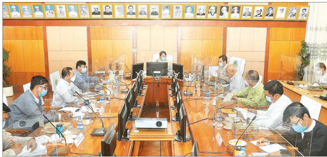
ပြည်ထောင်စုဝန်ကြီး ဒေါက်တာဖေမြင့် မြန်မာနိုင်ငံ သတင်းမီဒီယာကောင်စီ ဥက္ကဋ္ဌ ဦးအုန်းကြိုင် (ဟံသာဝတီ ဦးအုန်းကြိုင်) ဦးဆောင်သည့် အဖွဲ့အား လက်ခံတွေ့ဆုံစဉ်။