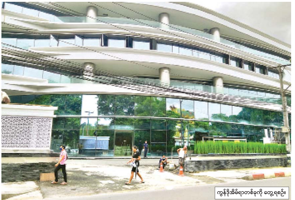
ကွန်ဒိုအိမ်ရာတစ်ခုကို တွေ့ရစဉ်။

ရန်ကုန်မြို့မှာတော့ ဗဟန်း၊ စမ်းချောင်း၊ ကြည့်မြင်တိုင်နဲ့ မရမ်းကုန်းမြို့နယ်တွေမှာ ကွန်ဒိုတိုက်ခန်းတွေ အများဆုံးတည်ရှိနေတာ ဖြစ်ပါတယ်။ အဲဒီမြို့နယ်တွေဟာ သွားလာရေး လွယ်ကူပြီး ရန်ကုန်မြို့ရဲ့ အဓိက အချက်အချာ ကျတဲ့နေရာတွေဖြစ်တာမို့ ပြည်တွင်း ပြည်ပ