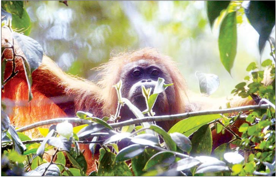
အင်ဒိုနီးရှားနိုင်ငံ စူမာတြားမြောက်ပိုင်းရှိ တောအုပ်တွင် ကျင်လည်ကျက်စားသည့် ရှားပါးမျောက်ဝံ မျိုးစိတ်တစ်ကောင် ကို တွေ့ရစဉ်။

သင်္ဘောဖြင့် တင်ဆောင်လာသည့် သားရဲတိရစ္ဆာန် များအသုတ်သည် အင်ဒိုနီးရှားနိုင်ငံမြောက်ပိုင်း ဆူလာဝေစီ ပြည်နယ်ရှိ ဘီတန်ဆိပ်ကမ်းသို့ ရက်အနည်းငယ်အတွင်း ဆိုက်ရောက်မည်ဖြစ်ကြောင်း သိရသည်။ အင်ဒိုနီးရှားနိုင်ငံတွင် အဆိုပါရှားပါးတိရစ္ဆာန်မျိုးစိတ် များကို ၎င်းတို့၏ စားကျက်မြေများဆီသို့ ပြန်မလွှတ်ပေးမီ ကယ်ဆယ်ရေးနှင့် ပြန်လည်ထူထောင်ရေးစင်တာ၌ ပြန်လည်ထူထောင်ရေး ဆောင်ရွက်ပေးမည်ဖြစ်ကြောင်း သိရသည်။ တရားမဝင်မှောင်ခိုကူးမှုမှ ပြန်လည်ကယ်ဆယ် လာခဲ့သည့် ရှားပါးသားရဲတိရစ္ဆာန်မျိုးစိတ်များအနက် အများစုမှာ အင်ဒိုနီးရှားနိုင်ငံအရှေ့ပိုင်းတွင် သဘာဝအရ ကျင်လည် ကျက်စားသည့် တိရစ္ဆာန်များဖြစ်ကြောင်း သိရသည်။ ဆင်ယူာ