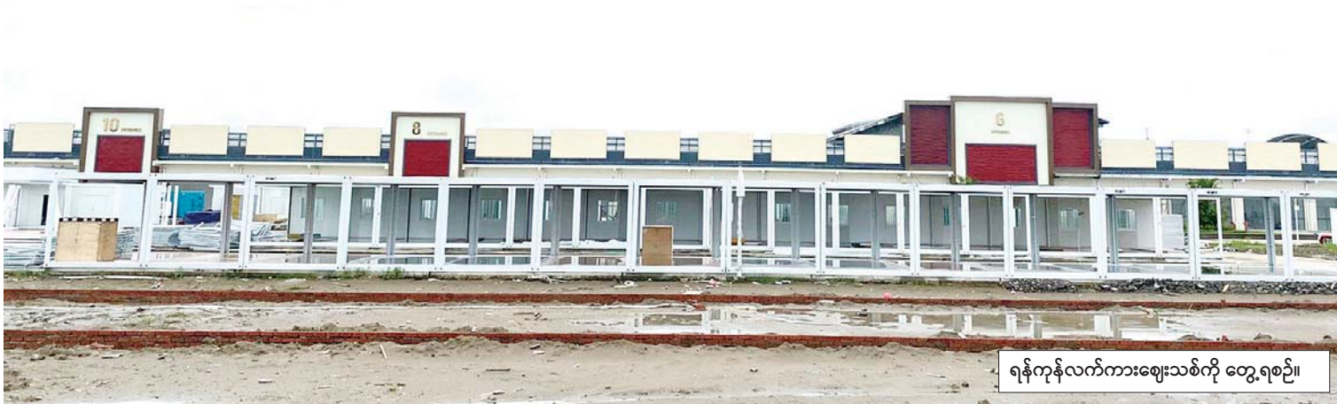
ရန်ကုန်လက်ကားဈေးသစ်ကို တွေ့ရစဉ်။

ကြတာဖြစ်ပါတယ်။ ကိုဗစ်-၁၉ အလွန်မှာ ပြန်လည်ကောင်း မွန်လာဖို့ရှိနေတဲ့ ရန်ကုန်မြို့ရဲ့ ကွန်ဒိုတိုက်ခန်း အရောင်းအဝယ် ဈေးကွက်အတွက်တော့ ကွန်ဒိုတိုက်ခန်းအသစ်တွေ ၁၅၀၀၀ ခန့် ထပ်မံ ပေါ်ထွက်လာဦးမှာမို့ ရန်ကုန်မြို့ပြရဲ့ လူမှုဘဝ နေထိုင်မှု တစ်ဖက်တစ်လမ်းက မြှင့်တင်ပေး ဦးမှာ အမှန်ပဲဖြစ်ပါတယ်။