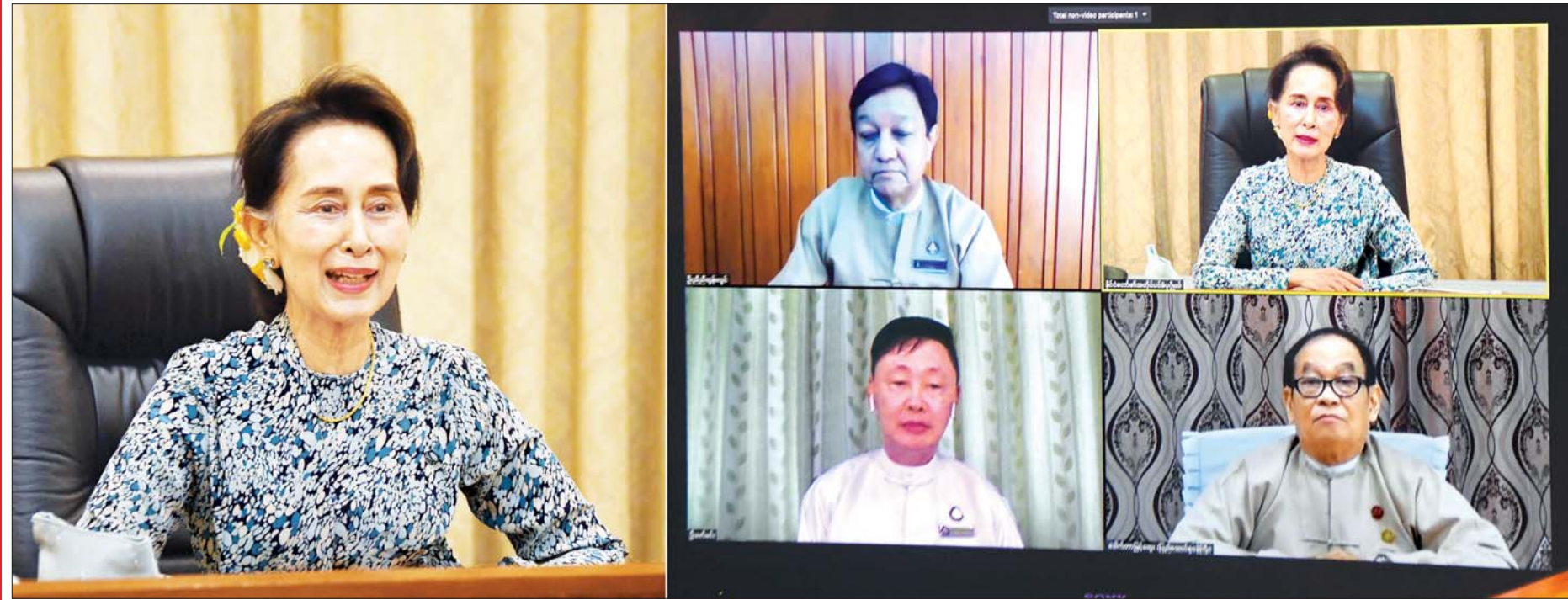
နိုင်ငံတော်၏အတိုင်ပင်ခံပုဂ္ဂိုလ် ဒေါ်အောင်ဆန်းစုကြည် COVID-19 ကာကွယ်၊ ထိန်းချုပ်၊ ကုသရေးကော်မတီတွင် ရုပ်ရှင်လုပ်ငန်းများ ပြန်လည်လည်ပတ်နိုင်ရေးနှင့်စပ်လျဉ်း၍ ကျန်းမာရေးနှင့် အားကစားဝန်ကြီးဌာန ပြည်ထောင်စုဝန်ကြီး ဒေါက်တာမြင့်ထွေး၊ မြန်မာနိုင်ငံရုပ်ရှင်အစည်းအရုံးဥက္ကဋ္ဌ ဦးညီညီထွန်းလွင်၊ မင်္ဂလာရုပ်ရှင်ရုံများအုပ်စု ဥက္ကဋ္ဌ ဦးဇော်မင်းတို့နှင့် Video Conferencing စနစ်ဖြင့် ချိတ်ဆက်တွေ့ဆုံပြီး လက်တွေ့အခြေအနေများကို အပြန်အလှန် ဆွေးနွေးစဉ်။

နေပြည်တော် ဇူလိုင် ၂၈ Coronavirus Disease 2019 (COVID-19) ကာကွယ်၊ ထိန်းချုပ်၊ ကုသရေး အမျိုးသားအဆင့် ဗဟိုကော်မတီဥက္ကဋ္ဌ၊ နိုင်ငံတော်၏အတိုင်ပင်ခံပုဂ္ဂိုလ် ဒေါ်အောင်ဆန်းစုကြည်သည် COVID-19 ကာကွယ်၊ ထိန်းချုပ်၊ ကုသရေးကော်မတီတွင် ရုပ်ရှင်လုပ်ငန်းများ ပြန်လည်လည်ပတ်နိုင်ရေးနှင့် စပ်လျဉ်း၍ ကျန်းမာရေးနှင့် အားကစားဝန်ကြီးဌာန ပြည်ထောင်စုဝန်ကြီး ဒေါက်တာမြင့်ထွေး၊ မြန်မာနိုင်ငံ ရုပ်ရှင်အစည်းအရုံးဥက္ကဋ္ဌ ဦးညီညီထွန်းလွင်၊ မင်္ဂလာရုပ်ရှင်ရုံများအုပ်စု ဥက္ကဋ္ဌ ဦးဇော်မင်းတို့နှင့် ယနေ့နံနက် ၁၀ နာရီတွင် နေပြည်တော်ရှိ နိုင်ငံတော်သမ္မတအိမ်တော် အစည်းအဝေးခန်းမ၌ Video Conferencing စနစ်ဖြင့် ချိတ်ဆက်တွေ့ဆုံပြီး လက်တွေ့အခြေအနေ များကို အပြန်အလှန် ဆွေးနွေးသည်။ စာမျက်နှာ ၃ ကော်လံ ၁ ၀