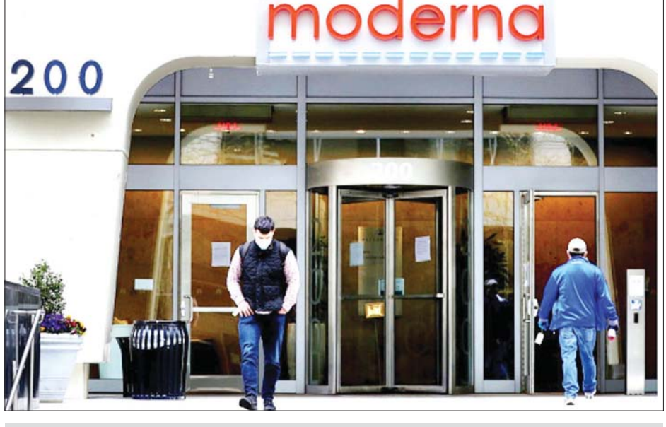
ဇီဝနည်းပညာကုမ္ပဏီ Moderna ဌာနချုပ်ကို တွေ့ရစဉ်။

သူ ၄၅ ဦးတွင် အားလုံးမှာ လုံခြုံစိတ်ချ ရမှုရှိပြီး ကိုယ်ခံအားစနစ်ကို လုံ့ဆော် ပေးကြောင်း မည်သူတစ်ဦး တစ်ယောက်တွင်မှ ပြင်းထန်သည့် ဘေးထွက်ဆိုးကျိုး ခံစားရခြင်းမရှိ ကြောင်း အမေရိကန်ဆေးပညာ ဂျာနယ်တွင် ယခုလအစောပိုင်းက ဖော်ပြခဲ့သည်။ အသက် ၁၈ နှစ်နှင့် အထက် စေတနာ့ဝန်ထမ်း ၃၀၀၀၀မှာ နောက်ဆုံးအဆင့် စမ်းသပ်မှုတွင်ပါဝင် ကြပြီး Moderna သည် လုံခြုံစိတ်ချရ သည့် ကာကွယ်ဆေးထုတ်လုပ်ရန် ရည်ရွယ်ထားကြောင်း ယခုစမ်းသပ်မှု ပြုလုပ်နေသည့်ဆေးဝါးသည် ကိုဗစ်- ၁၉ ကို အမှန်တကယ် ကာကွယ်ပေးနိုင် ခြင်း ရှိ မရှိ ဆုံးဖြတ်မည်ဖြစ်သည်။ တစ်နှစ်လျှင် ကာကွယ်ဆေး သန်းငါးရာ ထုတ်လုပ်ရန် ခန့်မှန်းထား ပြီး တစ်ဘီလီယံအထိလည်း တိုးမြှင့် ထုတ်လုပ်သွားနိုင်ကြောင်း ကုမ္ပဏီက ပြောသည်။ ကာကွယ်ဆေးထုတ်လုပ် ရေးအစီအစဉ်အတွက် အမေရိကန် အစိုးရထံမှ ဒေါ်လာသန်း ၄၇၂ သန်း ရရှိမည်ဟုလည်း Moderna ကုမ္ပဏီက ပြောသည်။ ကျိုဒို