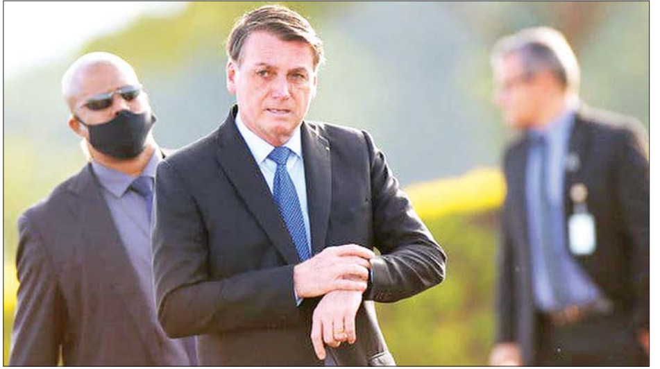
အအက်ပီစီ ကိုဗစ်-၁၉ ကူးစက်မှုမှ ပြန်လည်လွတ်မြောက်လာခဲ့သော ဘရာဇီးသမ္မတ ဂျာဘော့ဆွန်နာရို။

ဘော့ဆွန်နာရိုက ကိုဗစ်-၁၉ ကို တုပ်ကွေးအပျော့ စားအဖြစ် ဖော်ပြခဲ့ပြီး စီးပွားရေးဆောင်ရွက်ချက်များကို ဦးစားပေးခဲ့သည်။ ဘရာဇီးနိုင်ငံသည် ကိုဗစ်-၁၉ ကူးစက်မှုတွင် ကမ္ဘာ့ဒုတိယအများဆုံး ဖြစ်သည်။ ကူးစက်ခံရသူပေါင်း ၂ ဒသမ ၄ သန်းဖြင့် အမေရိကန်ပြည်ထောင်စု၏နောက်တွင် ရပ်တည်လျက်ရှိသည်။ ကိုဗစ်-၁၉ ကြောင့် ဘရာဇီးနိုင်ငံတွင် သေဆုံး သူပေါင်း ၈၆၀၀၀ ဦးရှိခဲ့ပြီး နိုင်ငံ၏ အဆင်းရဲဆုံးဒေသများ တွင် အဆိုးဆုံးဖြစ်ခဲ့သည်။ ဘရာဇီးသမ္မတသည် ကိုဗစ်-၁၉ လက္ခဏာ အနည်း အကျဉ်းသာခံစားခဲ့ရပြီး မကြာမီအချိန်အတွင်း ၎င်း၏ ရည်မှန်းချက်ဖြစ်သည့် စီးပွားရေးဆောင်ရွက်ချက်များ ကို ဆက်လက် လုပ်ဆောင်သွားမည်ဖြစ်ကြောင်း သိရ သည်။