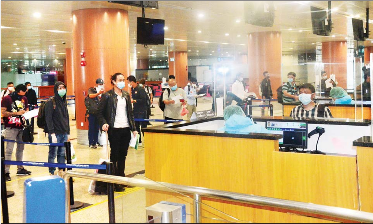
စင်ကာပူနိုင်ငံမှ ပြန်လည်ရောက်ရှိလာသည့် မြန်မာနိုင်ငံသားများကို တွေ့ရစဉ်။