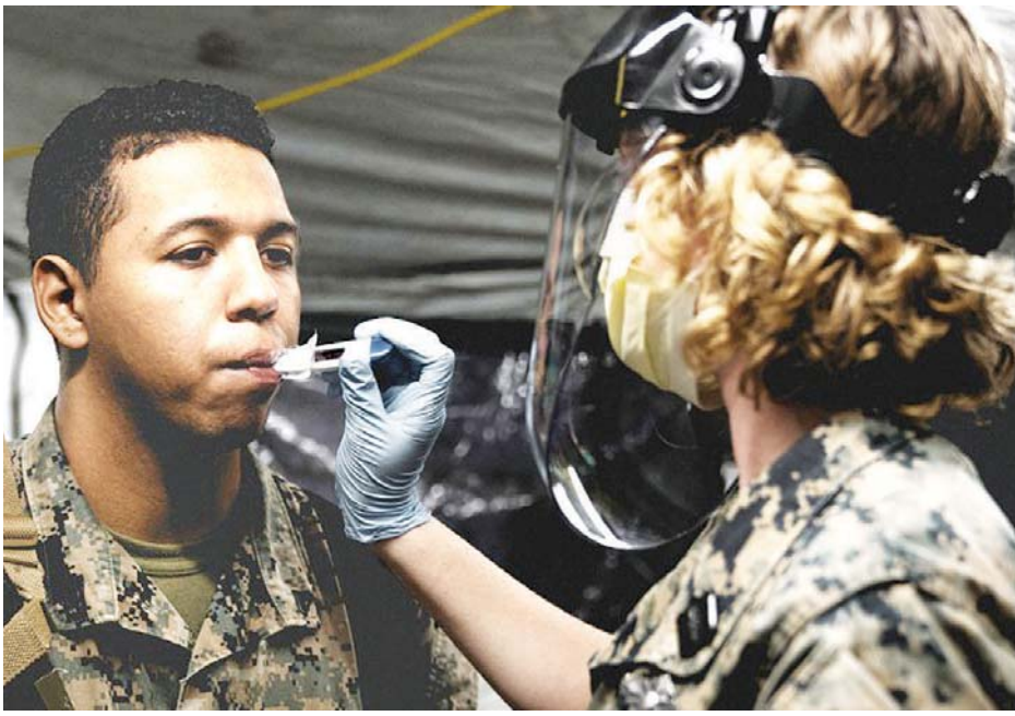
အမေရိကန်တပ်ဖွဲ့ဝင်တစ်ဦးကို ကိုဗစ်- ၁၉ စစ်ဆေးနေစဉ်။

ဂျပန်နိုင်ငံတွင် အခြေစိုက် ထားသည့် အမေရိကန်စစ်ခန်းများ တွင် ပြီးခဲ့သည့် ဇူလိုင် ၂၄ ရက်အထိ ကိုဗစ်- ၁၉ ကူးစက်ခံရသူ ၁၈၉ ဦး တွေ့ရှိခဲ့ကြောင်း အတည်ပြုခဲ့ပြီး နောက်တွင် ကာကွယ်ရေးဦးစီးချုပ်က ထိုသို့ ညွှန်ကြားချက်ထုတ်ပြန်ခဲ့ခြင်း ဖြစ်သည်။ ဂျပန်နိုင်ငံရှိ အမေရိကန် စစ်မှုထမ်းများနှင့် ၎င်းတို့၏ မိသားစု ဝင်များသည် လက်ရှိတွင် ကန့်သတ် စောင့်ကြည့်မှုအောက်တွင် နေထိုင် ရန် ညွှန်ကြားထားသည်။ ကိုဗစ်- ၁၉ ၏ စိန်ခေါ်မှုကို