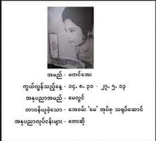
ကမည်း - မတင်တေး

ဒေါ်မေလွင်။ ။ လပြည့်ကျော်တစ်ရက် နေ့ဖွားပါ။ ကြည်စိုးထွန်း။ ။ ဟုတ်လား။ ဒါဆို မေတ္တာ အခါတော်နေ့ ခေါ်တာပေါ့။ ကောင်းလိုက်တာ အစ်မရယ်။ အစ်မကို စပြီးတော့ ကျွန်တော် သတိထားမိတဲ့ ကားပေါ့နော်။ သတိထားမိတဲ့ကားက “ဂုဏ်ရည်မတူ” ထင်တယ် အစ်မရဲ့။ ကျွန်တော်တို့ ကလေးဘဝကနော်၊ အဲဒါ အစ်မ စတင်တာထင်တယ်။ အဲဒီတော့ အစ်မ ရုပ်ရှင်ထဲကို ဘယ်လိုနည်းနဲ့ ရောက်တယ် ဆိုတာ သိချင်ပါတယ် အစ်မရယ်။