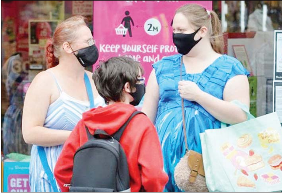
မြတ်နိုးနဲ့ ပြန်လည်ဖွင့်လှစ်လိုက်သည့် အရောင်းဆိုင်တစ်ခုတွင်ဝယ်ယူသူအချို့ကိုတွေ့ရစဉ်။

ကိုယ်ပိုင်အသိစိတ်နဲ့လိုက်နာဆောင်ရွက်မှု စီးပွားရေး ပြန်လည်နာလန်ထူဖို့ဆိုတဲ့ နေရာမှာ အမှန်တကယ်အားဖြင့် အကြောင်းနှစ်ခုရှိပါတယ်။ တစ်ခုကတော့ အစိုးရက ချမှတ်တဲ့ စည်းကမ်းတွေဖြစ်ပြီး နောက်တစ်ခုကတော့ ပြည်သူတစ်ဦးချင်းစီနဲ့ စီးပွားရေး လုပ်ငန်းတွေရဲ့ ကိုယ်ပိုင်အသိစိတ်နဲ့ ပြုမူဆောင်ရွက်ခြင်း တွေပါပဲ။ စီးပွားရေး မြန်မြန်ပြန်လည်နာလန်ထူလာ အောင် ဘယ်လိုလုပ်ကြမလဲလို့ မေးရင် တစ်ဦးချင်းစီရဲ့ ဘယ်လောက်အတိုင်းအတာအထိ လိုက်နာဆောင်ရွက် နိုင်စွမ်းရှိလဲဆိုတာကိုပါ သိရဖို့ လိုအပ်လာမှာဖြစ်ပါတယ်။