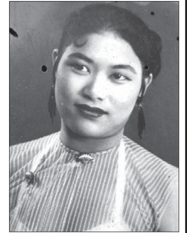
ယခင်- မေမြင့်ရီ