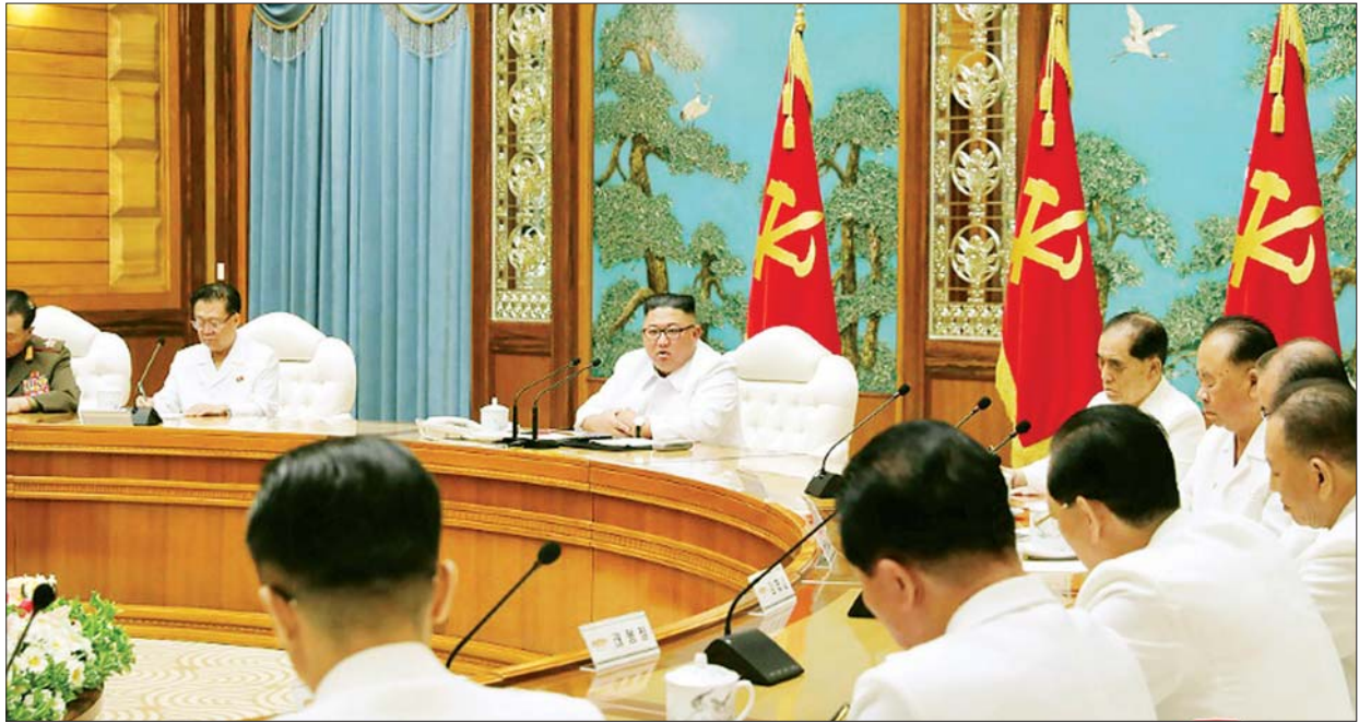
မြောက်ကိုရီးယားခေါင်းဆောင် ကင်ဂျီအန်း ဇူလိုင် ၂၅ ရက်က အရေးပေါ်အစည်းအဝေးတစ်ရပ် ကျင်းပစဉ်။

ခေါင်းဆောင်ကင်၏ညွှန်ကြားချက်အရ မြောက်ကိုရီးယားအလုပ်သမား ပါတီဗဟိုကော်မတီ၏ နိုင်ငံရေးဗျူရို အရေးပေါ်အစည်းအဝေးက နိုင်ငံတော် အရေးပေါ်အခြေအနေအမြင်ဆုံးဖြတ်မှု သတ်မှတ်အကောင်အထည်ဖော် ဆောင်ရွက်ရန် ဆုံးဖြတ်ခဲ့ကြောင်းသိရသည်။ အင်န်အိတ်ချ်ကေ