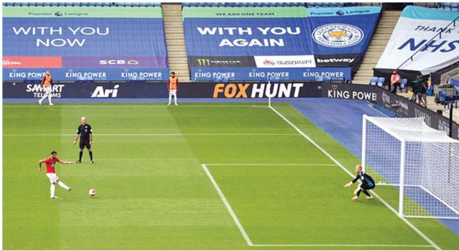
မန်ယူအတွက် အဖွင့်ဂိုးကို ကွင်းလယ်ကစားသမား ဖာနန်ဒက်စ်က ပယ်နယ်တီမှ ကန်သွင်းယူနေစဉ်။