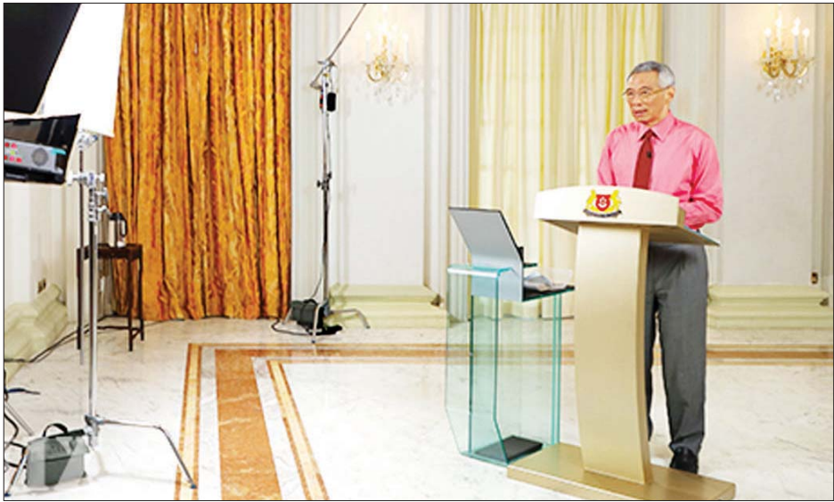
စင်ကာပူနိုင်ငံဝန်ကြီးချုပ် လီရှန်လွန်း

စင်ကာပူ ဇူလိုင် ၂၆ စင်ကာပူနိုင်ငံဝန်ကြီးချုပ် လီရှန်လွန်းက ဇူလိုင် ၂၅ ရက် က အစိုးရအဖွဲ့သစ် ဝန်ကြီးအဖွဲ့ဝင် အမည်စာရင်းကို ထုတ်ပြန်ခဲ့ပြီး ဝန်ကြီးချုပ်တာဝန်ကို လီရှန်လွန်းက ဆက်လက်ယူသွားမည်ဖြစ်ကြောင်း၊ ဒုတိယဝန်ကြီးချုပ်နှင့် စီးပွားရေးမူဝါဒစီမံရေးဆွဲမှုဝန်ကြီးဌာနဝန်ကြီးဘဏ္ဍာရေး ဝန်ကြီးဌာနဝန်ကြီး တာဝန်ကို ဟန်ဆွီကိတ်က ထမ်းဆောင်မည်ဖြစ်ကြောင်း သိရသည်။ လီရှန်လွန်းက ဇူလိုင် ၂၅ ရက်တွင် ကျင်းပသည့် ဗီဒီယိုသတင်းစာရှင်းလင်းပွဲမှတစ်ဆင့် ဝန်ကြီးအဖွဲ့ဝင် စာရင်းများကို ထုတ်ပြန်ကြေညာခဲ့ခြင်းဖြစ်သည်။ စင်ကာပူနိုင်ငံ အတိုင်ပင်ခံ တိုချီဟန်နှင့် သာမန်ရှန် မူဂရန်နန်တို့က အမျိုးသားလုံခြုံရေးစီမံရေးဆွဲမှုဝန်ကြီး ဌာနဝန်ကြီးနှင့် လူမှုရေးရာ မူဝါဒစီမံရေးဆွဲမှု ဝန်ကြီးဌာန ဝန်ကြီးများအဖြစ် အသီးသီး ခန့်အပ်ခံရကြောင်း သိရသည်။ ဝန်ကြီးအဖွဲ့သစ်တွင် နိုင်ငံခြားရေးဝန်ကြီးဌာန၊ ကာကွယ်ရေးဝန်ကြီးဌာန၊ ပြည်ထဲရေးဝန်ကြီးဌာန၊ ကုန်သွယ်စက်မှုဝန်ကြီးဌာနနှင့် ကျန်းမာရေးဝန်ကြီးဌာန တို့၏ ဝန်ကြီးနေရာများ အပြောင်းအလဲမရှိကြောင်း