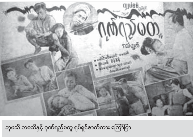
ဘုမသိ ဘမသိနှင့် ဂုဏ်ရည်မတူ ရုပ်ရှင်ဇာတ်ကား ကြော်ငြာ