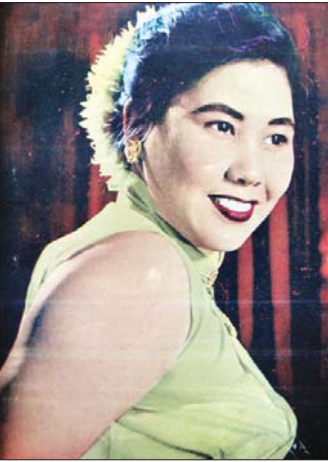
ယခင်- မေသဇင်