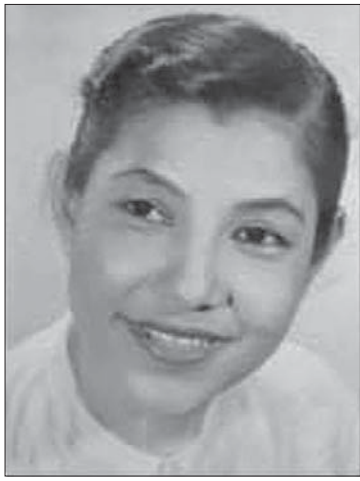
ဒေါ်မေနှဲ့