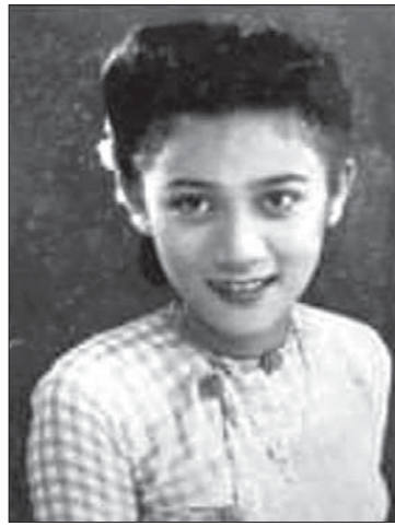
ဒေါ်မေသစ်