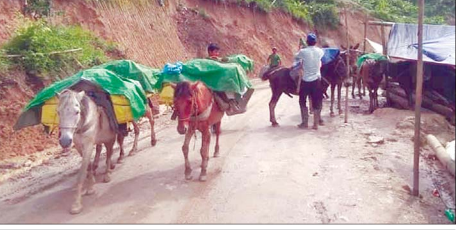
ခေါင်လန်ဖူးမြို့နယ်အတွက် ဆန်အိတ်များအား မြင်း၊ လားများဖြင့် သယ်ယူကြစဉ်။