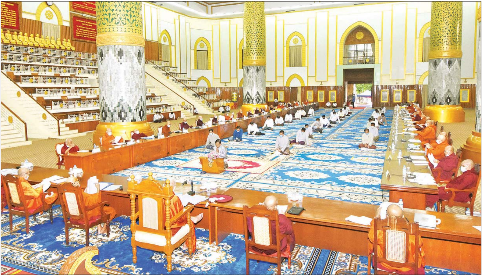
ပြည်ထောင်စုသမ္မတ မြန်မာနိုင်ငံတော် အဋ္ဌမအကြိမ် နိုင်ငံတော်သံဃမဟာနာယကအဖွဲ့ (၄၇)ပါးစုံညီ ပဉ္စမအစည်းအဝေး ပထမနေ့ ကျင်းပစဉ်။