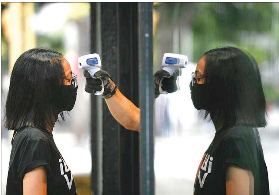
ဗင်နီဇွဲလားတွင် စတိုးဆိုင်ထဲသို့ ဝင်ရောက်လာသော ဈေးဝယ်သူတစ်ဦးကို ဝန်ထမ်းတစ်ဦးက အပူချိန်တိုင်းနေစဉ်။

ဝါရှင်တန် ဇူလိုင် ၂၆ ကမ္ဘာတစ်ဝန်း ကိုဗစ်-၁၉ ကူးစက်ခံ ရသူပေါင်း ၁၆ သန်းနီးပါး ရှိလာပြီ ဖြစ်ကြောင်း နိုင်ငံတကာသတင်း တစ်ရပ်တွင် ဇူလိုင် ၂၆ ရက်က ဖော်ပြ လိုက်သည်။ အမေရိကန် ပြည်ထောင်စု ဂျွန်ဟော့ကင်းတက္ကသိုလ် သုတေ သနပညာရှင်များ၏ ကမ္ဘာ့စံတော်ချိန် (ယူတီစီ) စနစ်ဖြင့် နံနက် ၆ နာရီ စစ်တမ်းဖော်ပြချက်အရ ကမ္ဘာ တစ်ဝန်း ကိုဗစ်-၁၉ ကူးစက်ခံရသူ ပေါင်း ၁၅၈၁၇၀၀ ဦးအထိရှိပြီး ၁၆ သန်းနီးပါးသို့ ရှိလာခဲ့ပြီး သေဆုံး သူပေါင်း ၆၄၁၂၄၃ ဦးရှိကြောင်း သိရသည်။ ကိုဗစ်-၁၉ ကူးစက်အခံရဆုံး ကမ္ဘာ့နိုင်ငံများစာရင်းတွင် အမေရိ ကန် ပြည်ထောင်စုသည် ကူးစက်ခံရ သူပေါင်း ၄ ဒသမ ၁၄ သန်းဖြင့် ထိပ်ဆုံးမှ ရပ်တည်လျက်ရှိပြီး ယင်းနောက်၌ ဘရာဇီးနိုင်ငံနှင့် အိန္ဒိယနိုင်ငံတို့ရှိသည်။ အလားတူ ကိုဗစ်-၁၉ ကြောင့် သေဆုံးမှုအများဆုံးနိုင်ငံ စာရင်းတွင် လည်း အမေရိကန်ပြည်ထောင်စု သည် ထိပ်ဆုံးမှ ရပ်တည်လျက်ရှိ