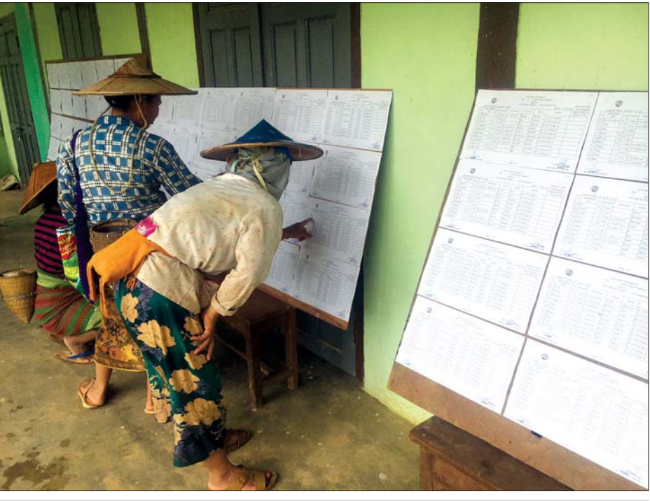
ကွန်ဟိန်းမြို့၌ မဲဆန္ဒရှင်စာရင်းများ ကြေညာထားမှုအား ပြည်သူများ ကြည့်ရှုကြစဉ်။

ရှမ်းပြည်နယ်တောင်ပိုင်း ကွန်ဟိန်းမြို့၌ ၂၀၂၀ ပြည့်နှစ် နိုဝင်ဘာ ၈ ရက်တွင် ပါတီစုံ ဒီမိုကရေစီရွေးကောက်ပွဲ အောင်မြင်စွာကျင်းပနိုင်ရေးအတွက် မြို့ပေါ်ရပ်ကွက်နှင့် ကျေးရွာများတွင် အသက် ၁၈ နှစ်ပြည့်ပြီး ဆန္ဒမဲပေးပိုင်ခွင့် ရှိသူ မဲဆန္ဒရှင်စာရင်းများကို ဇူလိုင် ၂၅ ရက်မှစတင်၍ ရပ်ကွက်/ကျေးရွာ ရွေးကော်မရှင်အဖွဲ့ခွဲများတွင် ပထမအကြိမ် ထုတ်ပြန်ကြေညာလျက်ရှိကြောင်း သိရသည်။