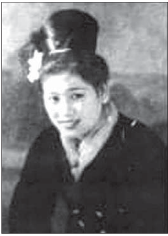
ဒေါ်မေရှင်