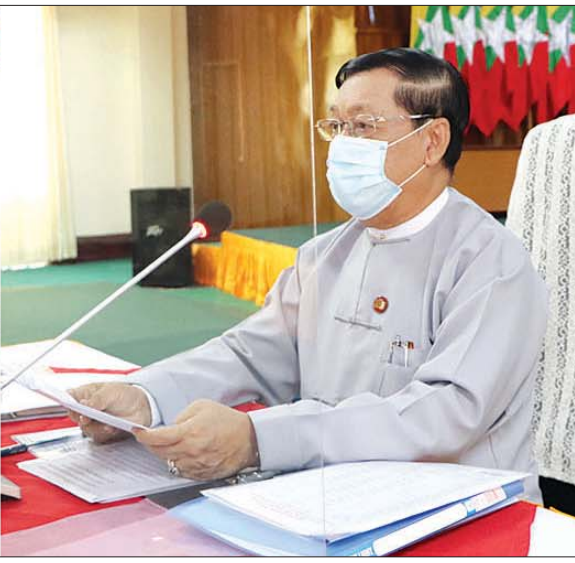
ပြည်ထောင်စုဝန်ကြီး ဦးသိန်းဆွေ လူဝင်မှုကြီးကြပ်ရေးနှင့် ပြည်သူ့အင်အားဆိုင်ရာ လုပ်ငန်းညှိနှိုင်းအစည်းအဝေးတွင် အမှာစကားပြောကြားစဉ်။ သတင်းစဉ်

တက်ရောက် အခမ်းအနားသို့ အလုပ်သမား၊ လူဝင်မှုကြီးကြပ်ရေးနှင့် ပြည်သူ့အင်အားဝန်ကြီးဌာန ပြည်ထောင်စုဝန်ကြီး ဦးသိန်းဆွေ၊ ဒုတိယဝန်ကြီး ဦးမြင့်ကြိုင်၊ အမြဲတမ်းအတွင်းဝန် ဦးအေးလွင်၊ ဦးစီးဌာနမှူးမှ ညွှန်ကြားရေးမှူးချုပ်များ၊ ဒုတိယညွှန်ကြားရေးမှူးချုပ်များနှင့် ညွှန်ကြားရေးမှူးများ၊ ပြည်ထောင်စုနယ်မြေ (နေပြည်တော်) အပါအဝင် တိုင်းဒေသကြီး/ပြည်နယ် ဦးစီးမှူးများနှင့် တာဝန်ရှိသူများ တက်ရောက်ကြသည်။ ရှေးဦးစွာ ပြည်ထောင်စုဝန်ကြီး ဦးသိန်းဆွေက မိမိတို့ဝန်ကြီးဌာနသည် နိုင်ငံတော်အစိုးရ၏ ဦးဆောင်လမ်းညွှန်မှုနှင့်အညီ လူဝင်မှုကြီးကြပ်ရေးနှင့် ပြည်သူ့အင်အားဆိုင်ရာ ရည်မှန်းချက်တာဝန် (၃) ရပ်ကို အကောင်အထည်ဖော် ဆောင်ရွက်လျက်ရှိကြောင်း၊ ဌာနအနေဖြင့် ပြီးခဲ့သည့်ကာလများတွင် သစ္စာစီမံချက်ဖြင့် ပြည်သူ့အကျိုးအတွက် ထိထိရောက်ရောက် အကောင်အထည်ဖော် ဆောင်ရွက်နိုင်ခဲ့သော်လည်း ယခုကာလတွင် ကမ္ဘာ့ကပ်ရောဂါဖြစ်သည့် ကိုဗစ်-၁၉ ရောဂါကြောင့် မိမိတို့ဌာနအပါအဝင် နိုင်ငံတော်အစိုးရ၏ လုပ်ငန်းဆောင်ရွက်မှုများ နှောင့်နှေး ရပ်တန့်သွားခဲ့ကြောင်း၊ ကြိုတင်စီမံဆောင်ရွက် ယခုအခါ ကိုဗစ်-၁၉ ကာကွယ်ထိန်းချုပ်မှုများကိုလည်း ဖြေလျှော့မှုများ ဆောင်ရွက်နေပြီဖြစ်သည့်အတွက် နိုင်ငံတကာ ဝင်/ထွက်သွားလာမှု ကန့်သတ်ချက်များကိုလည်း ဖြေလျှော့ခွင့်ပြုလာနိုင်ခြင်းကြောင့် အပြည်ပြည်ဆိုင်ရာ လေဆိပ်၊ ရေဆိပ်များ၊ နယ်စပ်ဂိတ်များ အပါအဝင် လူဝင်မှုစစ်ဆေးရေးဂိတ်များ