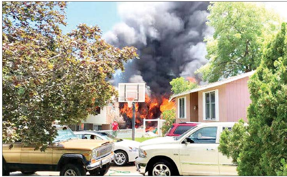
ယူတားပြည်နယ်ရှိ လေယာဉ်ပျက်ကျမှုဖြစ်ပွားသည့်နေရာတွင် မီးလောင်နေသည်ကို တွေ့ရစဉ်။

ယီမင်နိုင်ငံတွင် ဖြစ်ပွားနေသည့် ပဋိပက္ခသည် နိုင်ငံ၏ကျန်းမာရေးစနစ် ကိုပြိုလဲစေခဲ့ပြီး ကပ်ရောဂါများကျရောက်မှုကို တွန်းလှန်ရာတွင် အခက်အခဲဖြစ်စေခဲ့သည်။ ၂၀၁၇ ခုနှစ်မှစတင်ကာ နိုင်ငံအတွင်း လူ တစ်သန်းကျော်အထိ ကာလဝမ်းရောဂါကူးစက်ခံခဲ့ရပြီး သေဆုံးသူ ၂၀၀၀ ကျော်ရှိခဲ့ကြောင်း သိရသည်။ ဆင်ပဟာ