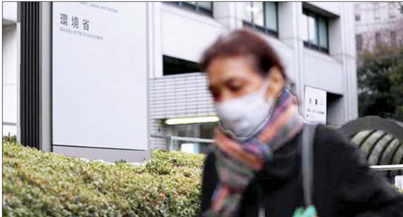
ဂျပန်နိုင်ငံ တိုကျိုရှိ ဂျပန်နိုင်ငံကျန်းမာရေးဝန်ကြီးဌာနရှေ့တွင် ပါးစပ်နှာခေါင်းစည်းတပ်ဆင်ပြီး လမ်းလျှောက်သွားနေသည့် လမ်းသွား လမ်းလာတစ်ဦးကို တွေ့ရစဉ်။