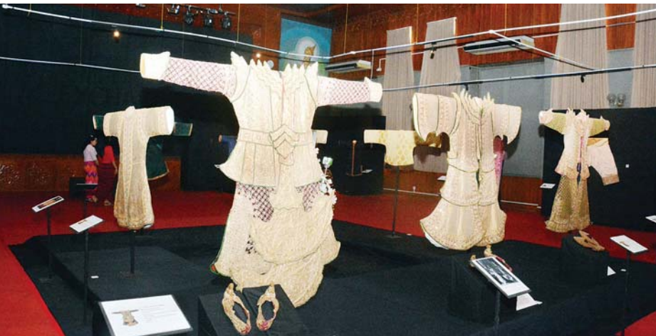
အမျိုးသားပြတိုက် (ရန်ကုန်) ၌ ရှမ်းစော်ဘွားများ၏ ရှားပါးဝတ်စုံများကို ခင်းကျင်းပြသထားစဉ်။