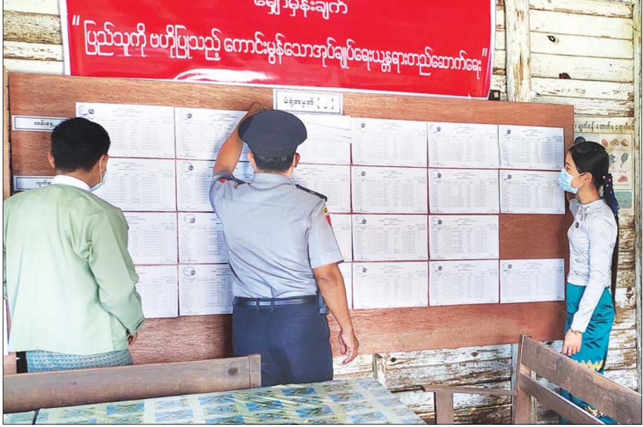
လဲချားမြို့နယ်၌ မဲဆန္ဒရှင်စာရင်းများ ကြေညာထားမှုအား တာဝန်ရှိသူများ ကြည့်ရှုစစ်ဆေးစဉ်။

စစ်ကိုင်းတိုင်းဒေသကြီး ကလေးမြို့နယ် အမှတ်(၁) မဲဆန္ဒနယ်တွင် မဲရုံပေါင်း ၁၀၂ ရုံ၊ ဆန္ဒမဲပေးပိုင်ခွင့်ရှိသူ ၁၃၈၂၆ ဦး၊ အမှတ်(၂) မဲဆန္ဒနယ်တွင် မဲရုံပေါင်း ၉၃ ရုံ၊