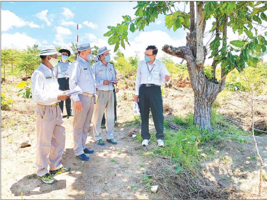
အညီ စိုက်ခင်းပြုစုပျိုးထောင်ခြင်း ဘာသာရပ်တွင် ညွှန်ကြားထားသည့် အတိုင်း လုပ်ငန်းသုံးပစ္စည်းကိရိယာများအား သူ့နေရာနှင့်သူ စနစ်တကျ သုံးစွဲရန်နှင့် ရာသီအလိုက်ဆောင်ရွက်ရမည့်လုပ်ငန်းများ အချိန်မီ ဆောင်ရွက်နိုင်ရေး စနစ်တကျ ကြီးကြပ်ဆောင်ရွက်ရန် မှာကြားသည်။ ထို့နောက် ပြည်ထောင်စုဝန်ကြီးသည် နေပြည်တော် - ကံပြားလမ်း မိုင်တိုင်အမှတ် ၂၈/၄ အနီး မကွေးတိုင်းဒေသကြီး အပူပိုင်းဒေသ စိမ်းလန်းစိုပြည်ရေး ဦးစီးဌာန၏ မြို့သစ်မြို့နယ် ၂/၂၀၁၉ အခြား တစ်မ စိုက်ခင်းသစ်မျိုးစုံအပင် ၅၀၀ စိုက်ပျိုးထားသည့်နေရာအား လည်း

နေပြည်တော် ဇူလိုင် ၂၅ သယံဇာတနှင့် သဘာဝပတ်ဝန်းကျင် ထိန်းသိမ်းရေး ဝန်ကြီးဌာန ပြည်ထောင်စုဝန်ကြီး ဦးအုန်းဝင်း သည် ယနေ့ နံနက်ပိုင်းတွင် မကွေးတိုင်းဒေသကြီး တောင်တွင်းကြီးမြို့နယ် နေပြည်တော်-ကံပြားလမ်း မိုင်တိုင်အမှတ် ၂၈/၁ အနီး ငမင်ကြီးပိုင်း အတွက်အမှတ် (၂၀၆) အတွင်း ၂၀၁၇ ခုနှစ် မိုးရာသီတွင် စိုက်ပျိုးတည်ထောင်ခဲ့သည့် တရုတ်-မြန်မာချစ်ကြည်ရေး သစ်မျိုးစုံစိုက်ခင်း ၄၅ ဧကသို့ ရောက်ရှိစစ်ဆေးသည်။