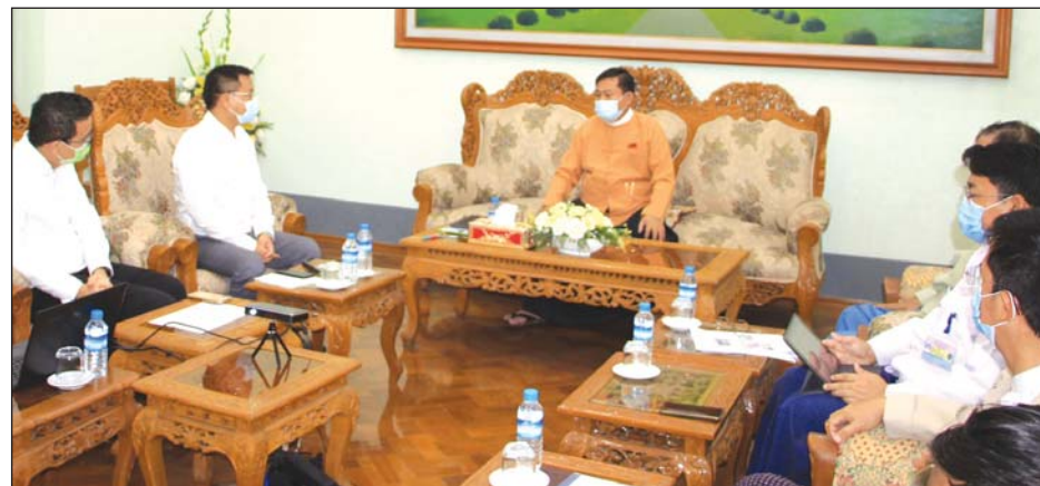
ရေအားလျှပ်စစ်နှင့် ဆိုလာစနစ်များဖြင့် ဓာတ်အားဖြန့်ဖြူးရေး အကောင်အထည်ဖော်ဆောင်ရွက်နိုင်ရန် ကုမ္ပဏီတာဝန်ရှိသူများက တိုင်းဒေသကြီးဝန်ကြီးချုပ် ဦးဝင်းသိန်းအား ရှင်းလင်းတင်ပြစဉ်။

ပဲခူး ဇူလိုင် ၂၅ ပဲခူးတိုင်းဒေသကြီးအတွင်း ရေအားလျှပ်စစ်နှင့် ဆိုလာစနစ်များဖြင့် ဓာတ်အားဖြန့်ဖြူးရေးကို အကောင်အထည်ဖော် ဆောင်ရွက်နိုင်ရေးအတွက် Ever Source Power ကုမ္ပဏီလီမိတက်မှ တာဝန်ရှိသူများသည် ပဲခူးတိုင်းဒေသကြီး ဝန်ကြီးချုပ် ဦးဝင်းသိန်းနှင့် တိုင်းဒေသကြီးအစိုးရ တာဝန်ရှိသူများအား ပဲခူးမြို့ တိုင်းဒေသကြီးအစိုးရအဖွဲ့ရုံး ဝန်ကြီးချုပ်ဦးဝင်းသိန်းနှင့် ဇူလိုင် ၂၄ ရက်က လာရောက်တွေ့ဆုံကာ လုပ်ငန်းဆိုင်ရာများ ရှင်းလင်းတင်ပြသည်။ ကုမ္ပဏီမှ အုပ်ချုပ်မှုဒါရိုက်တာ ဦးသန်းထွေးက ပဲခူးတိုင်းဒေသကြီး တောင်ငူမြို့နယ် ငွေတောင်လေးရွာ