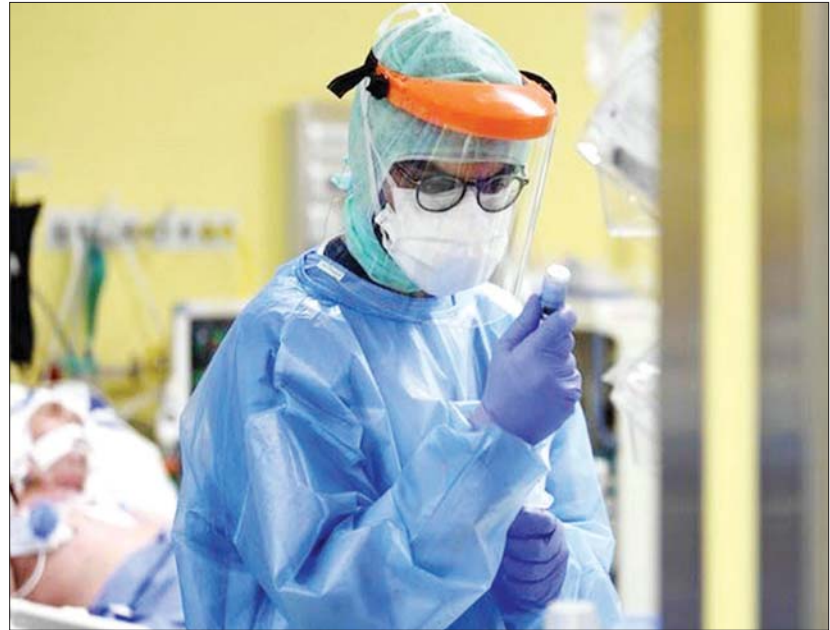
ဘရာဇီးနိုင်ငံရှိ ဆေးရုံတစ်ရုံ၌ ကိုဗစ်-၁၉ လူနာများအား ကုသမှုဆောင်ရွက်နေသည့် ကျန်းမာရေး ဝန်ထမ်းတစ်ဦးကို တွေ့ရစဉ်။

ဘရာဇီးနိုင်ငံအတွင်း ကိုဗစ်-၁၉ စတင်ကူးစက် ဖြစ်ပွားခဲ့သည့် မတ် ၂၄ ရက်မှစတင်ကာ ကပ်ရောဂါ ထိန်းချုပ်ရေးဆိုင်ရာ ကန့်သတ်ချက်များ ချမှတ် ခဲ့ပြီးနောက် ယခုတစ်ကြိမ်သည် ရှစ်ကြိမ်မြောက် အချိန်ထပ်တိုးခြင်းဖြစ်ကြောင်း သိရသည်။ ဆင်ဟွာ