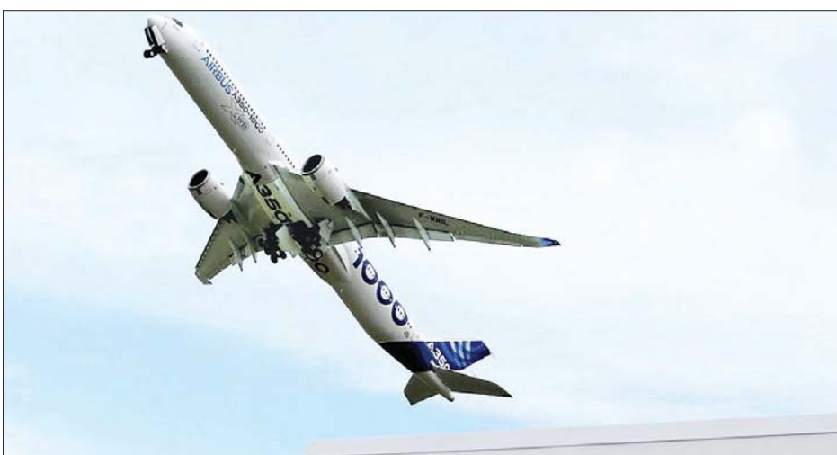
ပြင်သစ်နိုင်ငံတွင် ကျင်းပသော လေကြောင်းပြပွဲတွင် အဘတ်စ်အေ ၃၅၀- ၁၀၀၀ အမျိုးအစား ခရီးသည်တင် လေယာဉ်ပျံသန်းမှုကို တွေ့ရစဉ်။

အမေရိကန်နှင့် ဥရောပသမဂ္ဂ ကြား လေယာဉ်တည်ဆောက်ခြင်း လုပ်ငန်းတွင် ထောက်ပံ့မှုဆောင်ရွက် ခြင်းနှင့်ပတ်သက်ပြီး အငြင်းပွားမှု ဖြစ်ပွားနေသည့်မှာကာလကြာမြင့်ပြီ ဖြစ်သည်။ ၂၀၀၄ ခုနှစ်တွင် အမေရိကန်နိုင်ငံက ကမ္ဘာ့ကုန်သွယ် ရေး အဖွဲ့ချုပ်တွင် တရားစွဲဆိုမှုပြုလုပ် ခဲ့ပြီး ဥရောပသမဂ္ဂက နည်းလမ်း မျိုးစုံဖြင့် ခရီးသည်တင်လေယာဉ် တည်ဆောက်မှုလုပ်ငန်းတွင် တရား မဝင်ဆောင်ရွက်နေသည်ဟု စွပ်စွဲ