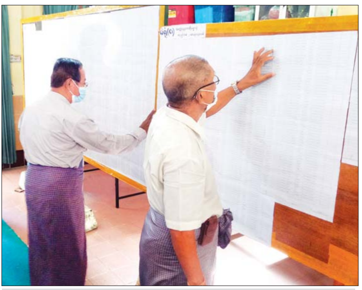
မဲစာရင်းလာရောက်ကြည့်ရှုသူများကို တွေ့ရစဉ်။