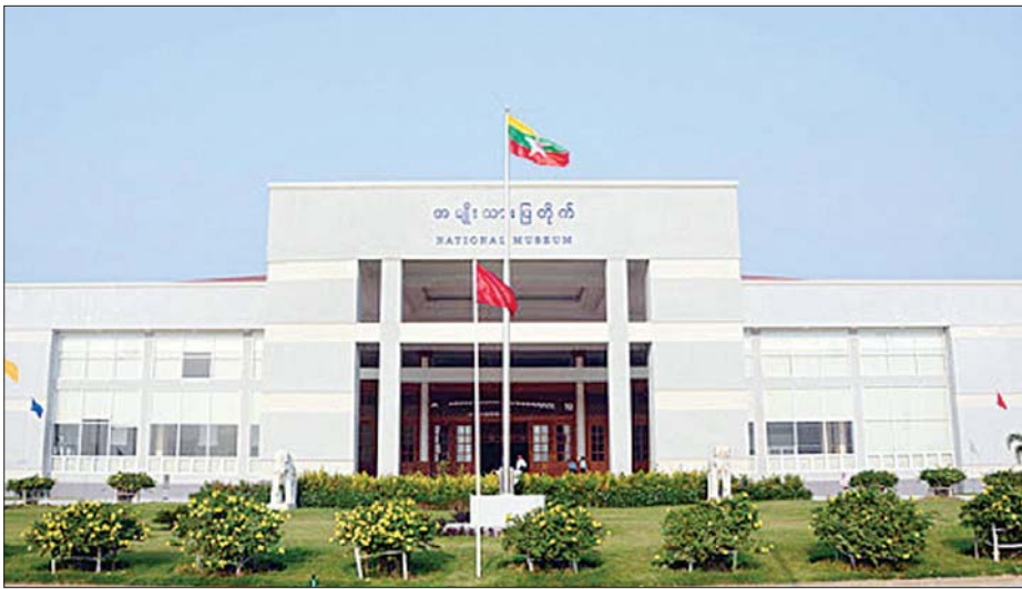
အမျိုးသားပြတိုက် (နေပြည်တော်) အဆောက်အအုံအား တွေ့ရစဉ်။

□ အမျိုးသားပြတိုက်ဆိုလျှင် "အမျိုးသား" ဟုအမည်တပ်နိုင်သော နိုင်ငံတော်အဆင့် သမိုင်းကြောင်း၊ ယဉ်ကျေးမှု၊ အနုပညာ၊ တိုင်းရင်းသားမျိုးနွယ်စု၊ ရှေးဟောင်း သုတေသနစသည့် ဘာသာရပ်ပေါင်းစုံ စုဆောင်းပြသရုံသာဖြင့် အထွေထွေပြတိုက် အမျိုးအစား ဟုလည်း သတ်မှတ်နိုင်သည်။ ကမ္ဘာကျော် လုပ်ပြတိုက်ကဲ့သို့ နေ့စဉ်အချိန် ပေး၍ တစ်လလောက်ကြည့်လျှင်ပင် မပြီးစီးလောက်အောင် စုဆောင်းပစ္စည်း စုံလင် များပြားလွန်းပါက အထွေထွေထက်ကျော်လွန်၍ စွယ်စုံပြတိုက်အမျိုးအစားဟု ခေါ်ကြောင်း မှတ်သားရ