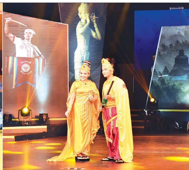
ပြည်ထောင်စုဝန်ကြီး ဒေါက်တာဖေမြင့် MRTV Auditorium ခန်းမ၌ တိုင်းရင်းသား ရိုးရာယဉ်ကျေးမှု ဝတ်စားဆင်ယင်မှု အကြံပြုရိုက်ကူးရေးပြင်ဆင်မှုကို ကြည့်ရှုစစ်ဆေးစဉ်။ သတင်းစဉ်

နှင့် MRTV Online Media လုပ်ငန်းဆောင်ရွက်မှု အခြေအနေများကို ရှင်းလင်းတင်ပြသည်။ ဆက်လက်၍ မြန်မာ့အသံနှင့်ရုပ်မြင်သံကြားရှိ အစီအစဉ်ထုတ်လုပ်သူ (PD)များက လုပ်ငန်းဆောင်ရွက်မှုအခြေအနေများကို တင်ပြကြရာ ပြည်ထောင်စုဝန်ကြီးနှင့် တာဝန်ရှိသူများက ပါဝင်ဆွေးနွေးမှုနှင့်အတူ ပြည်ထောင်စုဝန်ကြီးက လိုအပ်သည်များ ဆွေးနွေးမှာကြားသည်။