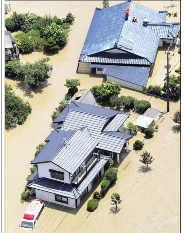
ဂျပန်နိုင်ငံအနောက်တောင်ပိုင်း ကူမာမိုတိုခရိုင်တွင် ပြီးခဲ့သည့် ဇူလိုင် ၄ ရက် က မိုးသည်ထန်စွာ ရွာသွန်းခဲ့မှုကြောင့် နေအိမ်များရေစစ်မြုပ်မှုကို တွေ့ရစဉ်။

ဇူလိုင် ၂၆ ရက် နံနက်ပိုင်းမှစတင်ကာ တိုကျိုနှင့် မိုးရေချိန် ၂၅၀ မီလီမီတာ အထိ ရွာသွန်းနိုင်ဖွယ်ရှိပြီး ရှိကူကူ၌ ၂၀၀ မီလီမီတာအထိ ရွာသွန်းနိုင်ကာ တောင်ပိုင်း ကျူးမြို့၊ ဟိုကူရီကူနှင့် ကန်တိုကျိုရှင် ဒေသများတွင် မိုးရေချိန် ၁၂၀ မီလီမီတာအထိ ရွာသွန်းနိုင်ဖွယ်ရှိကြောင်းနှင့် မြစ်ရေလျှံမှုနှင့် မြေပြိုမှုများ ဖြစ်နိုင်သည့် အန္တရာယ်ကိုသတိပြုကြရန် မိုးလေဝသအာဏာပိုင်များက သတိပေး ခဲ့သည်။ အင်အိတ်ချီကေ