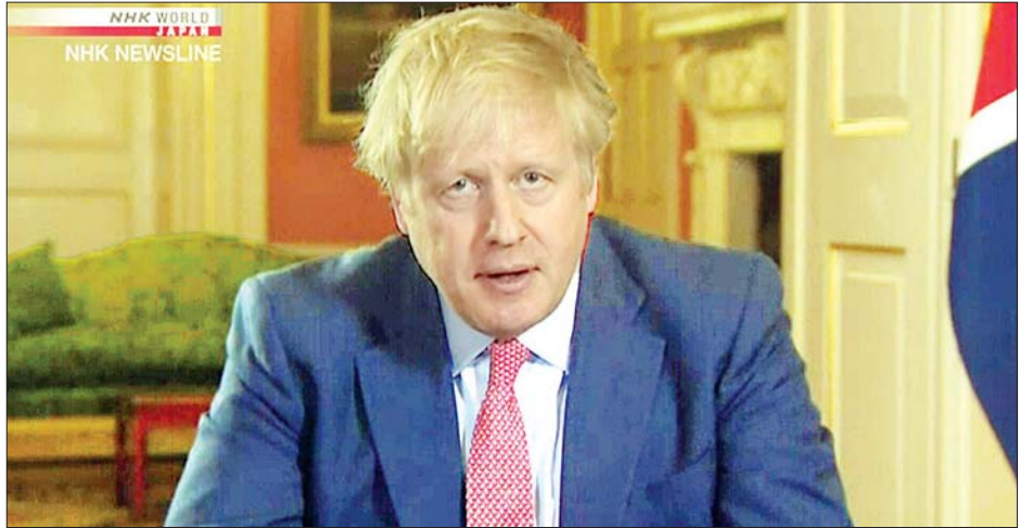
ဗြိတိန်ဝန်ကြီးချုပ် ဘောရစ်ဂျွန်ဆင်

ဘောရစ်ဂျွန်ဆင်က သူ့အနေဖြင့် အလွန်ခြင်းနှင့် ပတ်သက်သည့် ဆောင်ရွက်ချက်အသစ်များကိုလည်း ထပ်မံ ထုတ်ပြန်မည်ဖြစ်ကြောင်း၊ အလွန်ခြင်းသည်လည်း ကိုဗစ်- ၁၉ ကူးစက်ပြီးနောက် စိုးရိမ်ဖွယ်ကောင်းသော အချက်တစ်ချက်ဖြစ်ကြောင်း ၎င်းက ပြောကြားလိုက်သည်။ ဗြိတိန်ရှိပြည်သူများသည် ဥရောပ၏ တခြားနိုင်ငံ များတွင်ရှိသောသူများထက် နည်းနည်းပိုကြောင်း သူက