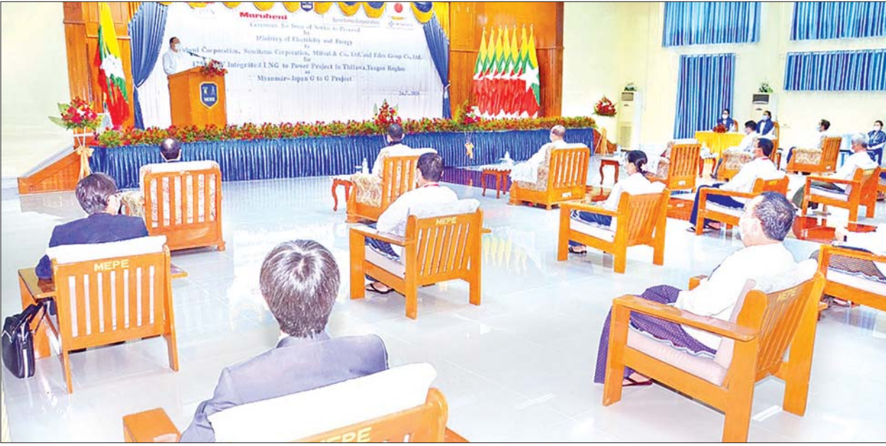
ပြည်ထောင်စုဝန်ကြီး ဦးဝင်းခိုင် ရန်ကုန်တိုင်းဒေသကြီး သီလဝါတွင် ရင်းနှီးမြှုပ်နှံမည့် LNG to Power စီမံကိန်းအား မြန်မာ-ဂျပန် G to G စီမံကိန်းအဖြစ် ဆောင်ရွက်နိုင်ရေးအတွက် Notice to Proceed ပေးအပ်ခြင်းအခမ်းအနားတွင် အမှာစကား ပြောကြားစဉ်။

နေပြည်တော် ဇူလိုင် ၂၄ ရန်ကုန်တိုင်းဒေသကြီး သီလဝါတွင် ရင်းနှီးမြှုပ်နှံမည့် LNG to Power စီမံကိန်းအဖြစ် ဆောင်ရွက်နိုင်ရေးအတွက် ဆက်စပ်ဆောင်ရွက်ရမည့် ပဏာမအကြံပြု လုပ်ငန်းစဉ်များဖြစ်သည့် လုပ်ငန်းစီမံချက်များ ရေးဆွဲခြင်း၊ ဒီဇိုင်းထုတ်ခြင်း၊ ခွင့်ပြုမိန့်များ လျှောက်ထားခြင်းနှင့် အကြံအပိုင် နီယာလုပ်ငန်းများ စတင်ဆောင်ရွက်နိုင်ရန် Notice to Proceed ပေးအပ်သည့် အခမ်းအနားကို ယနေ့နံနက် ၉ နာရီတွင် နေပြည်တော်ရှိ လျှပ်စစ်နှင့်စွမ်းအင်ဝန်ကြီးဌာန ရတနာခန်းမ၌ ကိုဗစ်-၁၉ ကာကွယ်ရေးနည်းစနစ်များနှင့်အညီ ကျင်းပသည်။