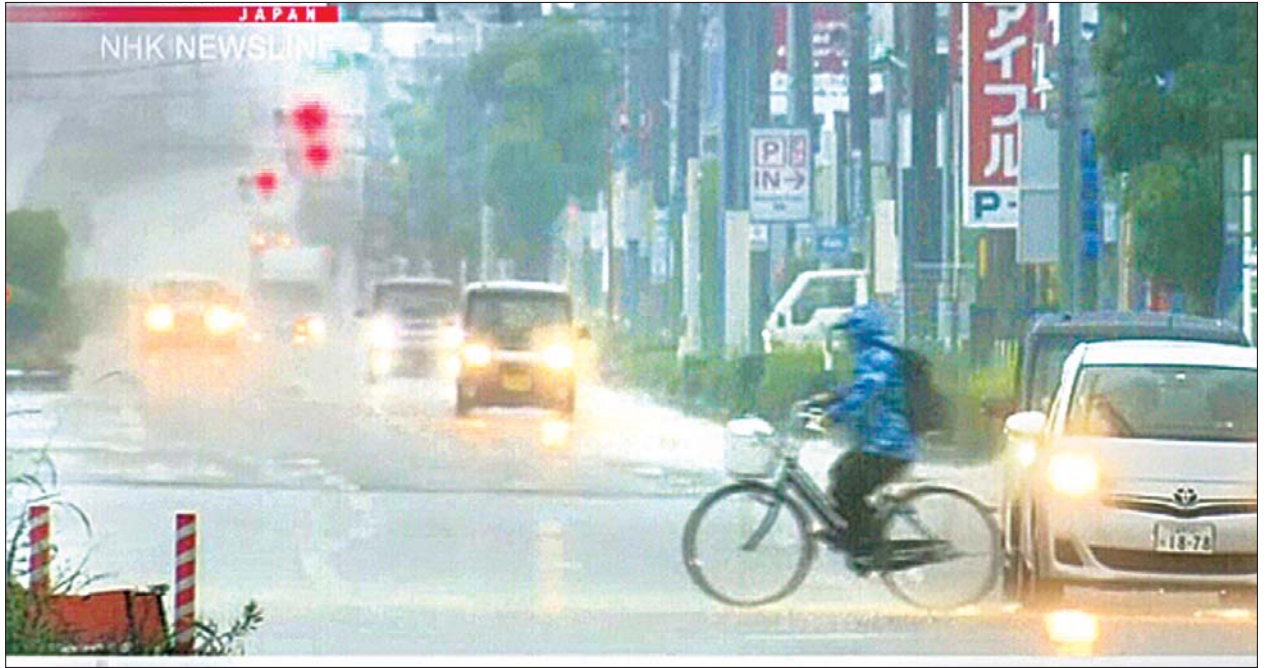
ဂျပန်နိုင်ငံ ကျွန်းကြားရှိ ဖူကူအိုကာမြို့တွင် မိုးသည်းထန်စွာရွာသွန်းလျက်ရှိသည်ကို တွေ့ရစဉ်။

ကျွန်းကြားနှင့် အခြားနေရာများတွင် မိုးသည်းထန်စွာရွာသွန်းမှုကို ခံစားနေ ရပြီး အဆိုပါနေရာများတွင် မိုးအနည်းငယ်ရွာရုံမျှဖြင့် သဘာဝဘေးအန္တရာယ်