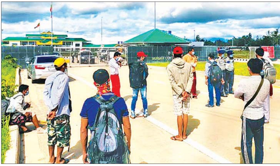
မြဝတီ အမှတ်(၂) ချစ်ကြည်ရေးတံတားမှ မြန်မာလည်ဝင်ရောက်လာသည့် မြန်မာရွှေ့ပြောင်းလုပ်သားများကို တွေ့ရစဉ်။

မြန်မာနိုင်ငံဝင်ရောက်လာသူများ အား ခရိုင်အုပ်ချုပ်ရေးမှူး ဦးတေဇာ အောင်၊ ဒုတိယခရိုင်အုပ်ချုပ်ရေးမှူး ဦးအောင်ချမ်းငြိမ်း၊ ခရိုင်နှင့် မြို့နယ် မှ တာဝန်ရှိသူများက ကြိုဆိုပြီး ကျန်းမာရေးစစ်ဆေးမှုနှင့် အခြားသော လိုအပ်ချက်များကို ဆောင်ရွက်နိုင်ရန် အတွက် သက်ဆိုင်ရာ ခရိုင်/မြို့နယ် မှ တာဝန်ရှိသူများက ကြီးကြပ် ဆောင်ရွက်လျက်ရှိကြောင်း သိရ သည်။ စာမျက်နှာ ၄ ကော်လံ ၁၀