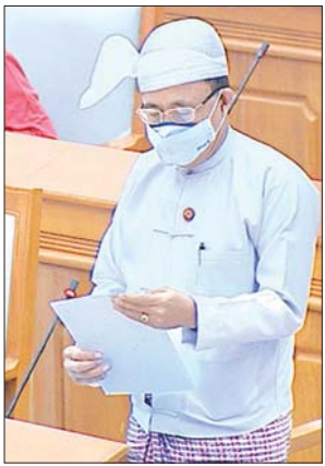
ပြည်ထောင်စုဝန်ကြီး ဦးကျော်တင်

ယခုတင်ပြခဲ့သည့် ၂၀၁၉ - ၂၀၂၀ ဘဏ္ဍာရေးနှစ်ပထမ ၆ လပတ် ရငွေနှင့် သုံးငွေ အကောင်အထည်ဖော်နိုင်မှုအခြေအနေများသည် အောက်တိုဘာလ မှ မတ်လအထိ ယာယီအမှန် အရအသုံးစာရင်းများသာ ဖြစ်ပါကြောင်း၊ ပြည်ထောင်စု၏ ဘဏ္ဍာငွေ အရအသုံးစာရင်းတွင် ပြင်ဆင်ရာ ဥပဒေပုဒ်မ ၁၈ ပါ ပြဋ္ဌာန်းချက်နှင့်အညီ တင်ပြလာသည့် ၂၀၁၉ - ၂၀၂၀ ခု ဘဏ္ဍာရေးနှစ် ပထမ ၆ လပတ် ပြည်ထောင်စု၏ ဘဏ္ဍာငွေ အရအသုံးဆိုင်ရာ အစီရင်ခံစာ ကို ပြည်ထောင်စုလွှတ်တော်က ဆွေးနွေးသုံးသပ်နိုင်ပါရန်နှင့် အတည်ပြု