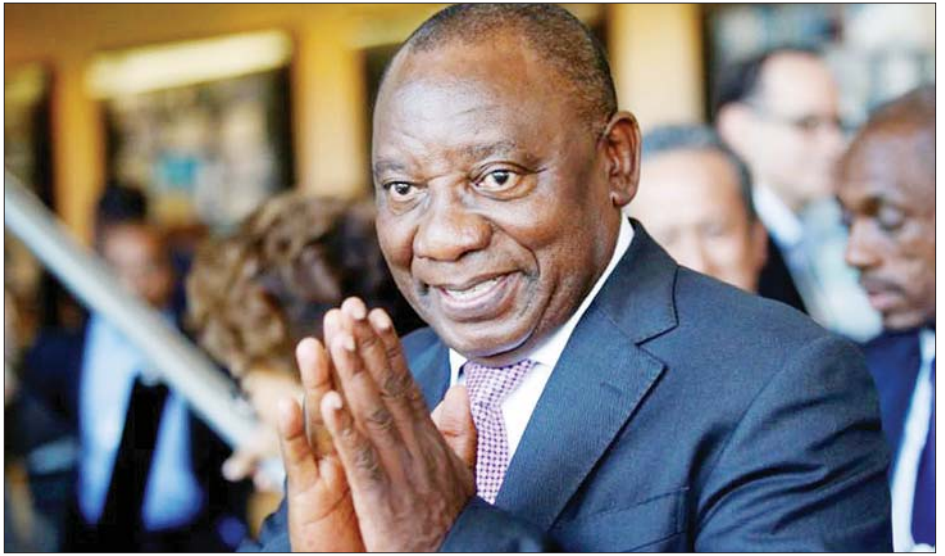
တောင်အာဖရိကသမ္မတ ရာမာဖိုးဆာ။

အစားအသောက် လိုအပ်သည့် အိမ်ထောင်စုများဆီသို့ ပို့ဆောင်လိုက်သည့် အစားအသောက်ထုပ်များ အခြား နေရာသို့ ရောက်သွားမည်ကို စိုးရိမ်မိကြောင်း၊ ပြည်သူ့ ဘဏ္ဍာငွေကို အလွဲသုံးစားပြုလုပ်မှုများနှင့် အကျင့်ပျက်မှု များရှိနေသည်ကို ထိရောက်စွာ အရေးယူသွားမည် ဖြစ်ကြောင်း ၎င်းက ပြောကြားခဲ့သည်။ တောင်အာဖရိကနိုင်ငံအတွင်း အထူးသဖြင့် ကိုဗစ်-၁၉ ကူးစက်ဖြစ်ပွားနေချိန်တွင် ကျန်းမာရေးကဏ္ဍ၌ ဝန်ဆောင် မှု ပေးမှုများတွင် အကျင့်ပျက်မှုများရှိနေကြောင်း တောင် အာဖရိကအကျင့်ပျက်ခြစားမှု စောင့်ကြည့်အဖွဲ့က အစီရင်ခံ ခဲ့ပြီးနောက် ရက်ပိုင်းအတွင်း သမ္မတ ရာမာဖိုးဆာက ထိုသို့ ပြောကြားခဲ့ခြင်းဖြစ်ကြောင်း သိရသည်။ အေအက်ဖ်ပီ