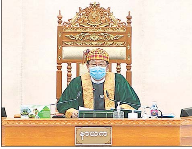
ဒုတိယအကြိမ် ပြည်ထောင်စုလွှတ်တော် (၁၇)ကြိမ်မြောက် ပုံမှန်အစည်းအဝေး ပဉ္စမနေ့ ကျင်းပစဉ်။

နှင့် ဆက်သွယ်ရေးကဏ္ဍများမှအပ ကျန်ကဏ္ဍများတွင် တစ်နှစ်လုံး ရည်မှန်းချက်အပေါ် ၅၀ ရာခိုင်နှုန်းကျော်နှင့် ၅၀ ရာခိုင်နှုန်းပတ်ဝန်းကျင်ခန့် အကောင်အထည်ဖော်နိုင်ခဲ့ပါကြောင်း၊ ကဏ္ဍအလိုက် စုစုပေါင်းပြည်တွင်း ထုတ်လုပ်မှုနှင့် ဝန်ဆောင်မှုတန်ဖိုး တိုးတက်မှုနှုန်းအနေဖြင့် သစ်တော ကဏ္ဍမှအပ ကျန်ကဏ္ဍများ၏ တိုးတက်မှုနှုန်းများသည် အသင့်အတင့်ရှိ သည့် အနေအထား ဖြစ်ပါကြောင်း။