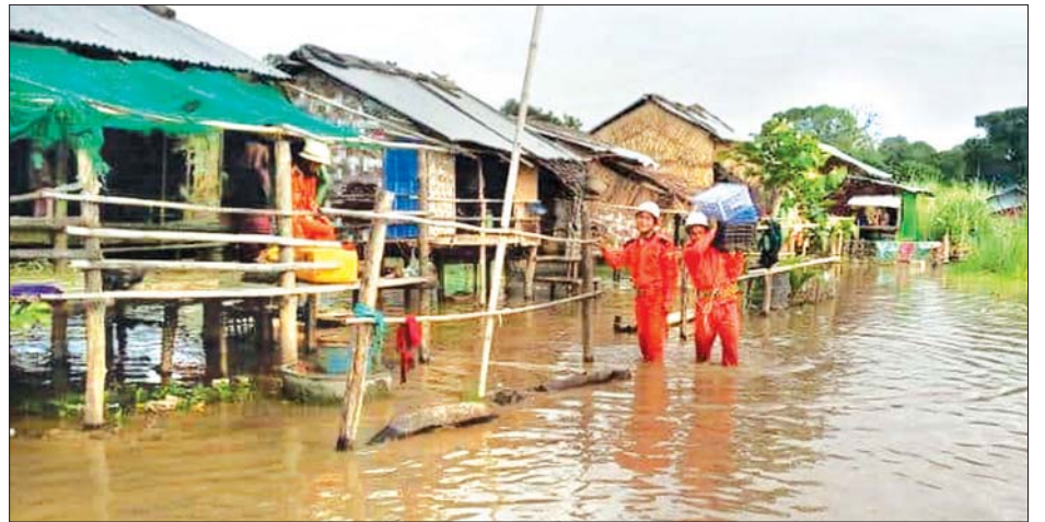
မြစ်ရေဝင်ရောက်သည့် နေအိမ်များမှ ပစ္စည်းများအား ကယ်ဆယ်ရေးအဖွဲ့ဝင်များက ကူညီပြောင်းရွှေ့ပေးစဉ်။

၄၀ အား ယာယီကယ်ဆယ်ရေးစခန်းအဖြစ် ဖွင့်လှစ် ထားသည့် ကံမမြို့နယ် အမှတ်(၂) ရပ်ကွက်ရှိတောင်ပေါ် ဘုန်းတော်ကြီးကျောင်းနှင့် သုံးထပ်ဘုန်းတော်ကြီး ကျောင်းများသို့ ယမန်နေ့က ပြောင်းရွှေ့ကူညီပေးခဲ့ သည်။ ကံမမြို့တွင် ရောဂါမြစ်ရေမြင့်တက်မှုကြောင့် ဇူလိုင် ၂၃ ရက် နံနက်ပိုင်းအထိ စုစုပေါင်းအိမ်ထောင်စု ၄၀ မှ လူဦးရေ ၁၅၃ ဦး ပြောင်းရွှေ့နေထိုင်လျက်ရှိကြောင်း မြို့နယ်မီးသတ်စခန်းမှ သိရသည်။ ဝေသူနွယ်(မြန်မာ့အလင်း)