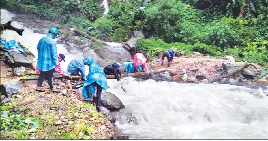
တံတားမော့ပါပျက်စီးသွားသဖြင့် ယာယီသစ်လုံးတံတား ဆောက်လုပ်နေစဉ်။