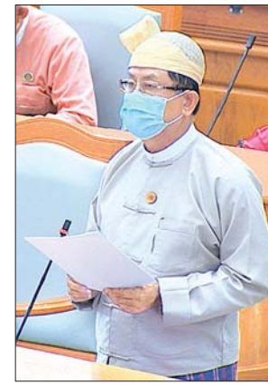
ဒုတိယဝန်ကြီး ဦးမောင်မောင်ဝင်း

မှတ်တမ်းတင်ပေးနိုင်ပါရန် တင်ပြအပ်ပါကြောင်း ပြောကြားသည်။