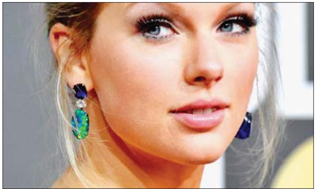
အဆိုတော်တေလာဆွစ်