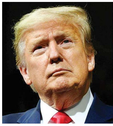
အမေရိကန်သမ္မတ ဒေါ်နယ်ထရမ်။