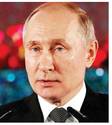
ရုရှားသမ္မတ ဗလာဒီမီာပူတင်။