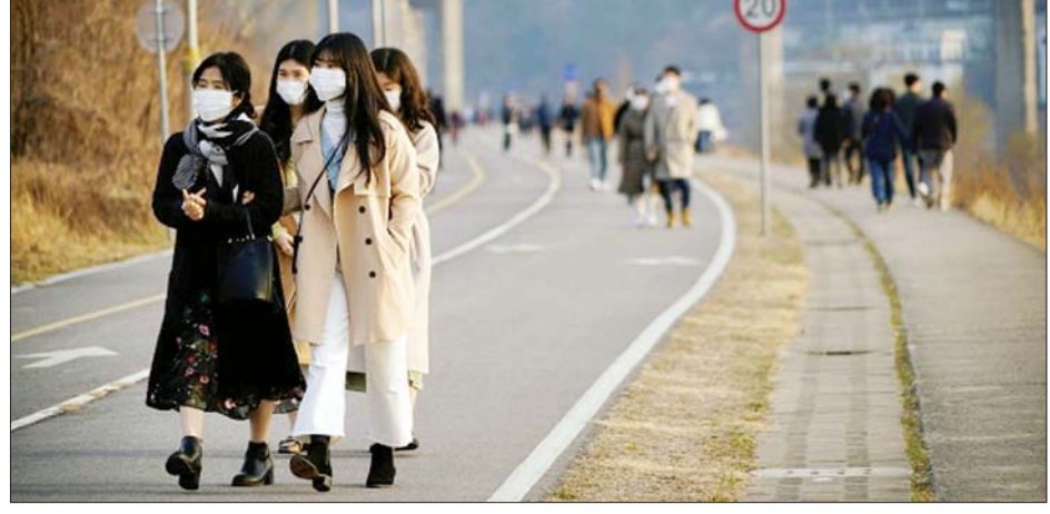
တောင်ကိုရီးယားနိုင်ငံ၌ ပြည်သူများ နှာခေါင်းစည်းတပ်ဆင်သွားလာနေစဉ်။

တောင်ကိုရီးယားနိုင်ငံတွင် ကိုဗစ်- ၁၉ ထပ်မံကူးစက်ခံရသူ ၄၁ ဦးတွေ့ရှိ ဆိုးလ် ဇူလိုင် ၂၄ တောင်ကိုရီးယားနိုင်ငံ၌ ဇူလိုင် ၂၄ ရက်တွင် ကိုဗစ်-၁၉ ထပ်မံကူးစက်ခံရ သူ ၄၁ ဦး ထပ်တိုးလာကြောင်း ကျန်းမာရေးဝန်ကြီးဌာနက သတင်း ထုတ်ပြန်ခဲ့သည်။ နိုင်ငံအတွင်း ရောဂါ ကူးစက်ခံရသူ အရေအတွက် စုစုပေါင်း မှာ ယခုအခါ ၁၃၉၇၉ ဦးအထိ ရှိသွားပြီဖြစ်သည်။ တောင်ကိုရီးယားနိုင်ငံအတွင်း ပြည်ပမှ ကိုဗစ်-၁၉ ကူးစက်ခံခဲ့ရမှုများ နှင့် ပြည်တွင်း၌ အစုလိုက် ကူးစက်ခံ ရမှုများ ဆက်တိုက်ဖြစ်ပွားနေမှု ကြောင့် နေ့စဉ်ရောဂါကူးစက်ဖြစ်ပွား မှုအရေအတွက် ဆက်လက်တိုးလာ လျက်ရှိသည်။ အသစ်ထပ်မံကူးစက်ခံရ သူများအနက် ၁၃ ဦးမှာ ပင်လယ်ရပ် ခြားမှ ကူးစက်ခံလာရခြင်းဖြစ်ပြီး ယင်းသို့ ကူးစက်ခံလာရသူ အရေ အတွက် စုစုပေါင်းမှာ ၂၁၅၈ ဦး ရှိပြီ ဖြစ်ကြောင်း သိရသည်။ ရောဂါကူးစက်မှုကြောင့် တစ်ဦး ထပ်မံသေဆုံးပြီး သေဆုံးသူအရေ အတွက် စုစုပေါင်း ၂၉၈ ဦး ရှိပြီဖြစ် သည်။ သေဆုံးသူ အရေအတွက်သည် နိုင်ငံအတွင်း ရောဂါကူးစက် ဖြစ်ပွားမှု အရေအတွက်၏ ၁၃.၁၁% ရာခိုင်နှုန်း ဖြစ်ကြောင်း သိရသည်။ ရောဂါကူး စက်မှုမှ ပြန်လည်သက်သာလာသည့် အတွက် ဆေးရုံမှဆင်းလာသူ နောက် ထပ် ၅၉ ဦးရှိရာ ပြန်ကောင်းလာသူ စုစုပေါင်း ၁၂၈၁၇ ဦး ရှိပြီဖြစ်ကြောင်း တောင်ကိုရီးယားကျန်းမာရေးဝန်ကြီး ဌာနက ဖော်ပြထားသည်။ တောင်ကိုရီးယားနိုင်ငံ၌ ပြီးခဲ့ သည့် ဇန်နဝါရီ ၃ ရက်မှစတင်ကာ ပြည်သူ ၁ ဒသမ ၅၁ သန်းကျော်ကို ဗိုင်းရပ်စ်စစ်ဆေးမှုများ ဆောင်ရွက်ခဲ့ ကြောင်း သိရသည်။ အေအက်ဖ်ပီ