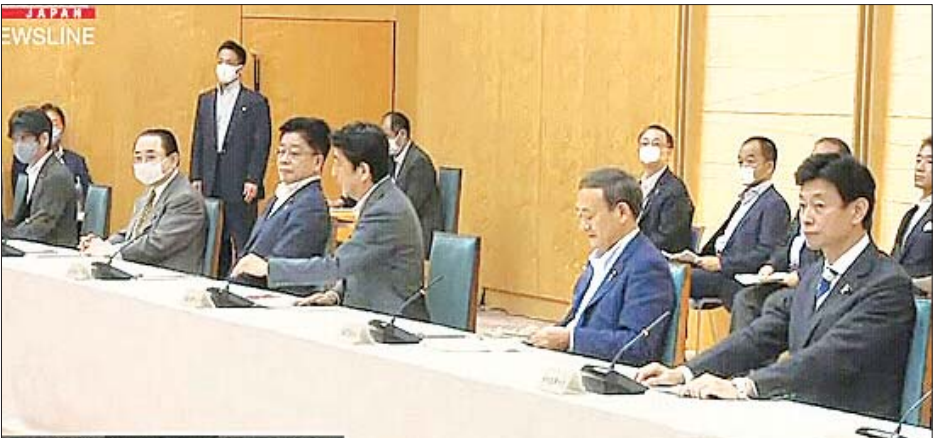
အစိုးရလုပ်ငန်းအဖွဲ့ အစည်းအဝေးကျင်းပနေသည်ကို တွေ့ရစဉ်။