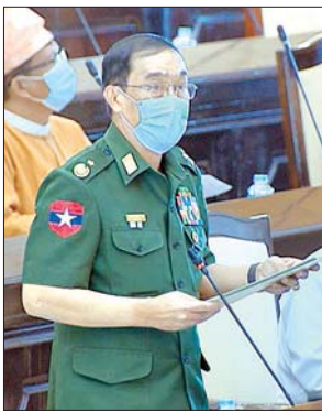
ဒုတိယဝန်ကြီး ဗိုလ်ချုပ်သန်းထွဋ်

အလားတူ ရခိုင်ပြည်နယ် မဲဆန္ဒနယ်အမှတ် (၅) မှ ဦးမြင့်နိုင် ၏ ကျောက်တော်မြို့နယ်အတွင်း ဂူပို့ထောင့်ကျေးရွာမှ လက်ခတ်ပင်ရင်းကျေးရွာ အထိ ကျေးရွာချင်းဆက်လမ်းပေါ်ရှိ တံတားများဖြစ်သော ဂေါ်ရောမဏီကျေးရွာ နှင့် ဇင်းခါးချေးကျေးရွာကြားရှိ သင်္ချာချောင်းကူးတံတားနှင့် ဇင်းခါးချေးကျေးရွာနှင့်