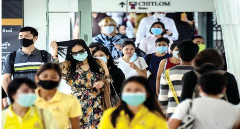
ဘန်ကောက်မြို့ပေါ်တွင် နာခေါင်းစည်းတပ်ဆင်သွားလာနေကြသည့် ပြည်သူများ။

ဗိုလ်ချုပ် ဆွမ်ဆက် ရွန်ဆီတာက ပြောကြားခဲ့သည်။ ဝေဖန်မှုများ မြင့်တက် အစိုးရ၏ နိုင်ငံတော်အရေးပေါ်အခြေအနေကြေညာချက် အချိန်ထပ်တိုးလိုက်မှုအပေါ် ဝေဖန်မှုများလည်း မြင့်တက်လျက်ရှိသည်။ ပြည်သူ ထောင်ချီဆန္ဒပြ ပြီးခဲ့သည့် ရက်သတ္တပတ်က ဘန်ကောက်မြို့လယ်ကောင်၌ ပြည်သူထောင်ချီဆန္ဒပြခဲ့ကြပြီး အစိုးရသည် နိုင်ငံရေးဆိုင်ရာ စုဝေးမှုများကို ပိတ်ပင်ရန် နိုင်ငံတော်အရေးပေါ် ကြေညာချက်ကို အသုံးပြုနေသည်ဟု ဆိုကာ ကန့်ကွက်ခဲ့ကြသည်။ သို့ရာတွင် အစိုးရက အရေးပေါ်လုပ်ပိုင်ခွင့်ကို ကပ်ရောဂါထိန်းချုပ်ရေးအတွက်သာ အသုံးပြုနေခြင်းဖြစ်ကြောင်း ပြောကြားခဲ့သည်။ အင်န်အိတ်ချ်ကော