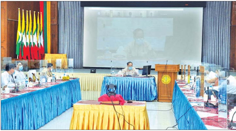
ပြည်ထောင်စုဝန်ကြီး ဒေါက်တာမြင့်ထွေး မြန်မာနိုင်ငံတိုင်းရင်းဆေးပညာကဏ္ဍ ပိုမိုဖွံ့ဖြိုးတိုးတက်ရေး ကိစ္စရပ်များ ဆွေးနွေးပွဲ တက်ရောက်စဉ်။

တိုင်းရင်းဆေးပညာရှင်ကြီးများ ပါဝင်သော တိုင်းရင်းဆေးပညာရပ် ဆိုင်ရာ အကြံပေးအဖွဲ့ကိုလည်း ဖွဲ့စည်းခဲ့ကာ တိုင်းရင်းဆေးပညာ ကဏ္ဍ ဘက်စုံဖွံ့ဖြိုးတိုးတက်ရေး