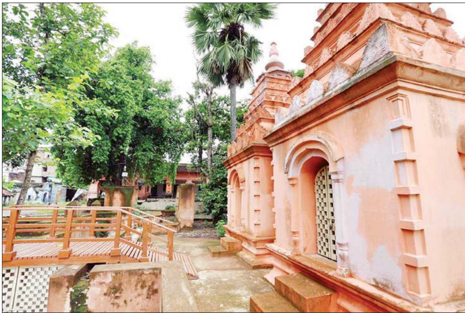
ဗုဒ္ဓဂယာမှ မင်းတုန်းမင်းတရားကြီး လှူဒါန်းခဲ့သော ပြုပြင်ပြီးတွေ့ရသည့် သာသနိကအဆောက်အအုံများ။

နှစ်အတန်ငယ်ကြာပြီးနောက် သီဟိုဠ်နိုင်ငံမှ ဗုဒ္ဓ ဘာသာဝင်သူတော်စင် အနာဂါရိယဓမ္မပါလအမည်ရှိ ပုဂ္ဂိုလ်သည် ဗုဒ္ဓဂယာသို့ ရောက်ရှိခဲ့ပါသည်။ ထိုပုဂ္ဂိုလ် ကြီးသည် ဗုဒ္ဓမြတ်စွာဘုရား၏ အထွတ်အမြတ်နေရာ များကို ဗုဒ္ဓဘာသာဝင်သူတော်စင်များ၏ လက်ထဲသို့ ရောက်ရှိရမည်ဟူသော သန့်ဋ္ဌာန်ချမှတ်ပြီး ကြိုးစား ဆောင်ရွက်ခဲ့ပါသည်။ အနာဂါရိယဓမ္မပါလ၏ စွမ်းဆောင် မှုများကြောင့် ကမ္ဘာပေါ်ရှိ ဗုဒ္ဓဘာသာဝင်များအကြား ဗုဒ္ဓဂယာနှင့်ပတ်သက်၍ နိုးကြားမှုများ ရှိလာခဲ့ပါသည်။ သီရိလင်္ကာနိုင်ငံသား အနာဂါရိယဓမ္မပါလ စွမ်းနိုင်