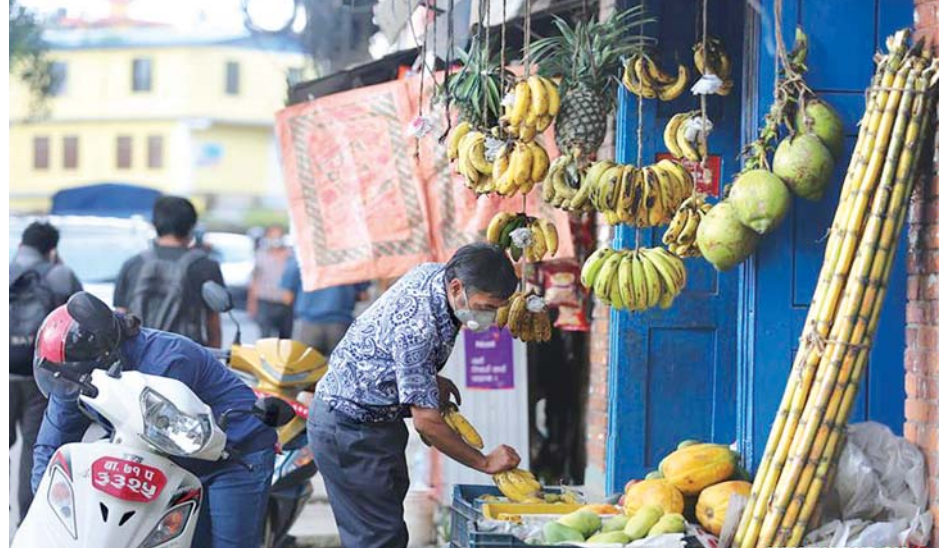
နီပေါနိုင်ငံ၌ ကန့်သတ်ပိတ်ဆို့မှု ရုပ်သိမ်းလိုက်ပြီးနောက် ဈေးဆိုင်အချို့ ပြန်လည်ဖွင့်လှစ်နေစဉ်။

ဘရာဇီးသမ္မတ ဇူလိုင် ၂၃ ဘရာဇီးသမ္မတ ဂျာလ်ဘော်ဆွန်နာရိုကို သုံးကြိမ်မြောက် ကိုဗစ်-၁၉ ဗိုင်းရပ်စ် စစ်ဆေးမှုပြုလုပ်ခဲ့ရာ ၎င်းထံ၌ ပိုးဆက်လက်ရှိနေသေးကြောင်း တွေ့ရှိခဲ့ရသည့်အတွက် သီးခြားကန့်သတ်စောင့်ကြည့်မှု ခံယူရမည်ဖြစ်ကြောင်း သမ္မတရုံးက ဇူလိုင် ၂၂ ရက်တွင် ပြောကြားခဲ့သည်။ ဇူလိုင် ၂၂ ရက်က သမ္မတ ဂျာလ်ဘော်ဆွန်နာရိုသည် သုံးကြိမ်မြောက် စစ်ဆေးမှုခံယူခဲ့ပြီးနောက် ဘရာဇီးသမ္မတရုံးရှိ သမ္မတရုံးက ဗိုင်းရပ်စ်ရှိ နေသော်လည်း သမ္မတကြီး၏ ကျန်းမာရေးအခြေအနေမှာ ကောင်းမွန်လျက်ရှိကြောင်း ဖော်ပြချက်တစ်စောင်ထုတ်ပြန်ခဲ့သည်။ ပြီးခဲ့သည့် ဇူလိုင် ၇ ရက်က သမ္မတဂျာလ်ဘော်ဆွန်နာရိုသည် ကိုယ်လက်မအိမ်သာဖြစ်ပြီး အများရှိသည့် လူကွဲကားများ ခံစားခဲ့ရပြီးနောက် ၎င်းထံ၌ ကိုဗစ်-၁၉ ကူးစက်ခံစားရသည်ကို စစ်ဆေးတွေ့ရှိရကြောင်း ကြေညာခဲ့သည်။ ယင်းအချိန်မှစတင်ကာ သမ္မတသည် လူထုအခမ်းအနားပွဲများ တက်ရောက်ခြင်းမပြုတော့ဘဲ ၎င်း၏နေအိမ်မှနေ၍ အလုပ်လုပ်ခဲ့သည်။ ထို့နောက် ပြီးခဲ့သည့်ရက်သတ္တပတ်က ကျန်းမာရေးစစ်ဆေးမှုခံယူခဲ့ရာ ကိုဗစ်-၁၉ ဗိုင်းရပ်စ် ဒုတိယအကြိမ်ထပ်မံတွေ့ရှိခဲ့သည်။ ယခုအခါ သမ္မတ ဂျာလ်ဘော်ဆွန်နာရိုကို ကျန်းမာရေးစစ်ဆေးမှုသုံးကြိမ်တိုင်တိုင် လုပ်ဆောင်ပြီးပြီဖြစ်ပြီး ၎င်းထံ၌ ကိုဗစ်-၁၉ ဗိုင်းရပ်စ်ဆက်လက်ရှိသေးကြောင်း သိရသည်။ ဆင်ဟွာ