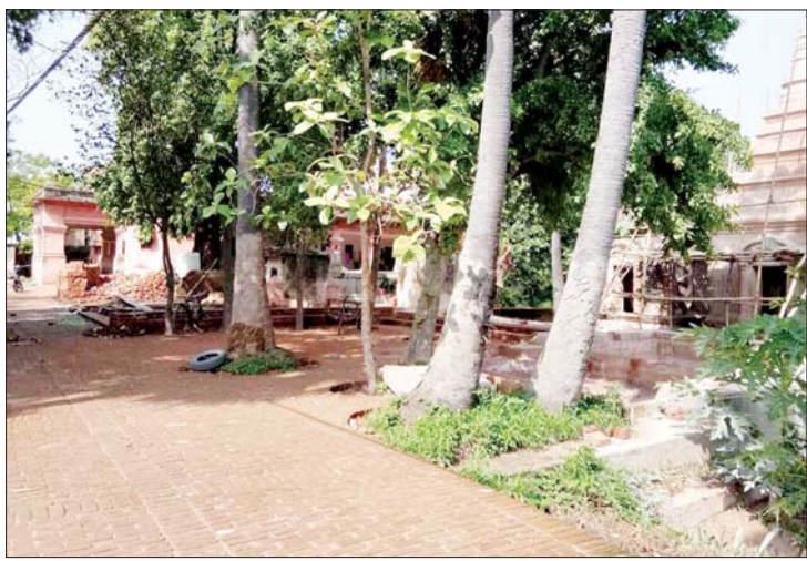
ဗုဒ္ဓဂယာမှ မင်းတုန်းမင်းတရားကြီးလှူဒါန်းခဲ့သော ပြုပြင်ပြီးတွေ့ရသည့်သာသနိက အဆောက်အအုံများ။