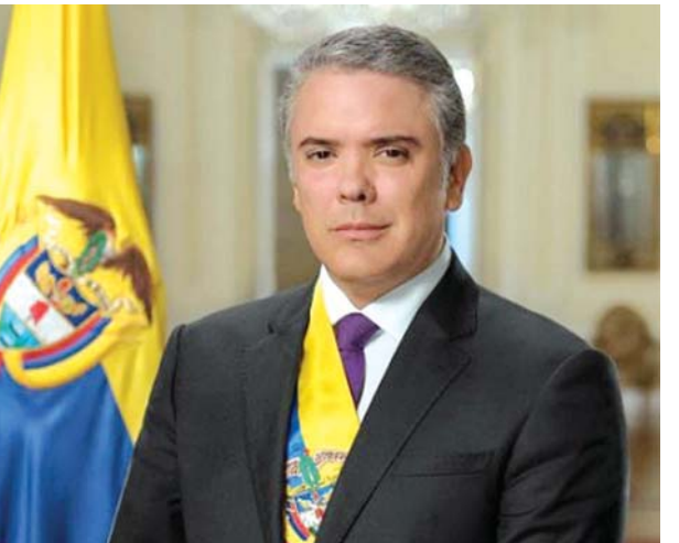
ကိုလံဘီယာ သမ္မတ အီဗန်ဒု

ဘိုကိုတာ ဇူလိုင် ၂၃ ကိုလံဘီယာသမ္မတ အီဗန်ဒုသည် အဓမ္မမှုကျူးလွန်သူများနှင့် ကလေးသူငယ်သတ်ဖြတ်မှုများအား ကျူးလွန်သူများကို တစ်သက်တစ်ကျွန်းထောင်ဒဏ်ချမှတ်နိုင်ရေးအတွက် ဖွဲ့စည်းပုံအခြေခံဥပဒေပြုပြင်ရေးကို ဇူလိုင် ၂၂ ရက်က ပြုလုပ်လိုက်သည်။ ယနေ့ ကိုလံဘီယာအနေဖြင့် အပြစ်ကင်းစင်သည့် ကလေးများကို မတရားကျူးလွန်သည့် လူမိုက်လူရမ်းကားများအတွက် မည်သည့်စကားမှ ပြောနေတော့မည်မဟုတ်ကြောင်း အီဗန်ဒုက ပြောကြားလိုက်သည်။ ပုံမှန်အားဖြင့် ကိုလံဘီယာတွင် တစ်နေ့လျှင် အသက် ၁၈ နှစ်အောက် ကလေးနှစ်ယောက် သတ်ဖြတ်ခံနေရကြောင်း သိရသည်။ မူခင်းဆေးပညာအရာရှိများ၏ ပြောကြားချက်များအရ ၂၀၁၉ ခုနှစ်တွင် အသက် ၁၈ နှစ်အောက် ကလေးပေါင်း ၂၅၀၀ ခန့်မှာ လိင်ပိုင်းဆိုင်ရာပြစ်မှုများ၏ သားကောင်များဖြစ်ခဲ့ကြောင်းနှင့် ၎င်းတို့အနက် ၇၀၈ ဦးသေဆုံးခဲ့ကြောင်း သိရသည်။ ဇန်နဝါရီလနှင့် မေလကြားတွင် လိင်ပိုင်းဆိုင်ရာ စော်ကားခံရသူပေါင်း ၆၅၀၀ နီးပါးရှိကြောင်း မက်ဒီဆီနာဥပဒေအဖွဲ့က ပြောကြားလိုက်သည်။ အခုအချိန်အထိ ကိုလံဘီယာနိုင်ငံတွင် အများဆုံးပေးနိုင်သောထောင်ဒဏ်မှာ နှစ် ၆၀ ဖြစ်သည်။ ပြစ်မှုထင်ရှားသည့်တိုင် ဖွဲ့စည်းပုံအခြေခံဥပဒေက ပြည်နှင့်ဒဏ်ပေးခြင်း၊ တစ်သက်တစ်ကျွန်းပြစ်ဒဏ်ပေးခြင်းတို့ကို တားမြစ်ထားကြောင်း သိရသည်။ ယခု အဆိုပါဖွဲ့စည်းပုံအခြေခံဥပဒေကို ပြင်ဆင်လိုက်ပြီဖြစ်သည်။ အဆိုပါဥပဒေကို အတိုက်အခံနိုင်ရေးသမားများ၊ ပညာရှင်များနှင့် ကျွမ်းကျင်သူများက ဝေဖန်ထားသည်။ ထောင်ဒဏ်တိုးမြှင့်သတ်မှတ်လိုက်ခြင်းသည် ပြစ်မှုများကို လျော့နည်းစေမည့် ရလဒ်ထွက်ပေါ်လာမည် မဟုတ်ကြောင်း ၎င်းတို့က ပြောကြားလိုက်သည်။