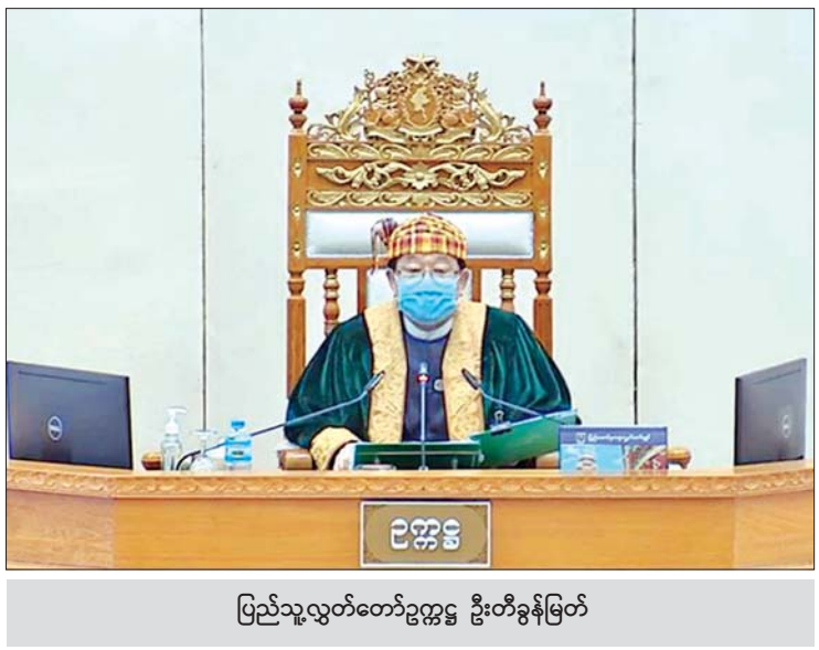
ပြည်သူ့လွှတ်တော်ဥက္ကဋ္ဌ ဦးတီခွန်မြတ်

အဆိုပါတာဝန်ပျက်ကွက်မှုအတွက် ဝန်ထမ်းအပေါ် ဌာနဆိုင်ရာ အရေးယူမှုတွင် ဝန်ထမ်းစည်းကမ်းဆိုင်ရာ ပြစ်ဒဏ်(၉)မျိုးအနက် ပြစ်ဒဏ်တစ်ရပ်ကိုဖြစ်စေ၊ ပြစ်ဒဏ်တစ်ရပ်ထက်ပို၍ဖြစ်စေ ချမှတ်နိုင်ကြောင်းနှင့် စာမျက်နှာ ၆ ကော်လံ ၁ ❖