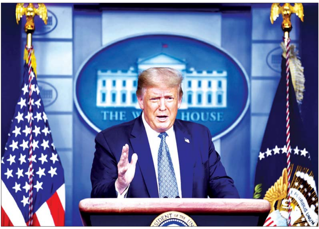
အမေရိကန်သမ္မတ ဒေါ်နယ်ထရမ်

ကာကွယ်ဆေးတွေ အပြိုင်ဖော်ထုတ် စီးပွားရေးတွေ ပုံမှန်အတိုင်း ပြန်လည် လည်ပတ်နိုင်ဖို့နဲ့ ပုံမှန်လူမှုဘဝကို ပြန်ရဖို့ ကိုဗစ် -၁၉ ကာကွယ်ဆေးထုတ်ဖို့ ဆိုတာ အခုဆိုရင် ပိုလို့တောင် အရေးကြီးလာပြီ။ ကနဦး ကာကွယ်ဆေးအမျိုးအစားပေါင်း ၂၀၀ လောက်ကို တိုးတက်