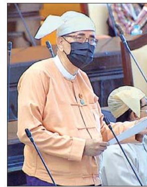
ဒုတိယဝန်ကြီး ဦးကျော်မျိုး