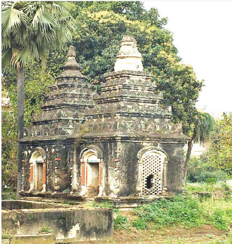
ဗုဒ္ဓဂယာမှ မင်းတုန်းမင်း တရားကြီး လှူဒါန်းခဲ့သော မပြုပြင်မီ တွေ့ရသည့် သာသနိက အဆောက် အအုံများ။

သာဓုရရှိနိုင်ရန် ကြိုးစားဆောင်ရွက်ပြီးသည့်နောက် ရခိုင် ဆရာတော်ကြီး အရှင်စန္ဒာမုနိသည် ဗုဒ္ဓဂယာသို့ ရောက်ရှိ လာပြီး ဗုဒ္ဓဂယာအား ဗုဒ္ဓဘာသာဝင်များ၏ လက်ထဲ သို့ ပြန်လည်ရောက်ရှိစေရန်နှင့် မင်းတုန်းမင်းကြီး၏ သာသနိက အဆောက်အအုံများ ပြန်လည်ရရှိရေးကြိုးစား ဆောင်ရွက်ခဲ့ပါသည်။ အရှင်စန္ဒာမုနိသည် အသက် အန္တရာယ်နှင့် ကြုံတွေ့ခဲ့ရသည်ကိုပင် အခက်အခဲများကို ရင်ဆိုင်၍ မကြောက်မရွံ့ မဆုတ်မနစ်သည့် ကြိုးစား အားထုတ်မှုဖြင့် ဆောင်ရွက်ချက်ကြောင့် ဤသာသနိက အဆောက်အအုံများအား အပြည့်အဝ ပြန်လည်ရရှိခဲ့ သော်လည်း အိန္ဒိယဖွဲ့စည်းအုပ်ချုပ်ပုံ အခြေခံဥပဒေ ဦးဆောင်ရေးဆွဲခဲ့သူ ရခိုင်ဆရာတော်ကြီး ဦးစန္ဒာမုနိ၏ တပည့် တရားသူကြီးချုပ် ဥပဒေပညာရှင် ဒေါက်တာ အမ်ဘေကာ ဦးဆောင်မှုဖြင့် ဟိန္ဒူဇာတ်နိမ့်လူမျိုး ငါးသောင်းကျော်မှာ ၁၉၅၃ ခုနှစ်က နာဂပူမြို့တွင် ဗုဒ္ဓ ဘာသာဝင်များ ဖြစ်လာပါသည်။ ယင်းနောက် ဒေါက်တာ အမ်ဘေကာ၏ ကူညီပံ့ပိုးမှုကြောင့် အိန္ဒိယနိုင်ငံတွင် ဗုဒ္ဓဘာသာ ပြန်လည်နိုးကြားလာပြီး ဗုဒ္ဓဂယာအား ပြန်လည် ထိန်းသိမ်းခွင့်များ ပြန်လည် ရရှိခဲ့ပါသည်။ သို့ရာတွင် ဗုဒ္ဓဘာသာဝင်များ၏ လက်ထဲသို့ အပြည့်အဝ မရောက်ရှိခဲ့သေးပါ။