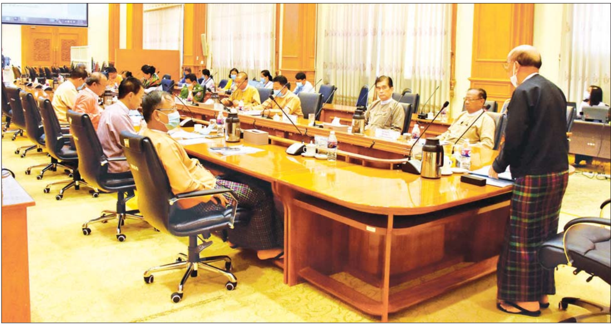
ပြည်ထောင်စုလွှတ်တော် ဥပဒေကြမ်းပူးပေါင်းကော်မတီ အစည်းအဝေး ကျင်းပစဉ်။ သတင်းစဉ်