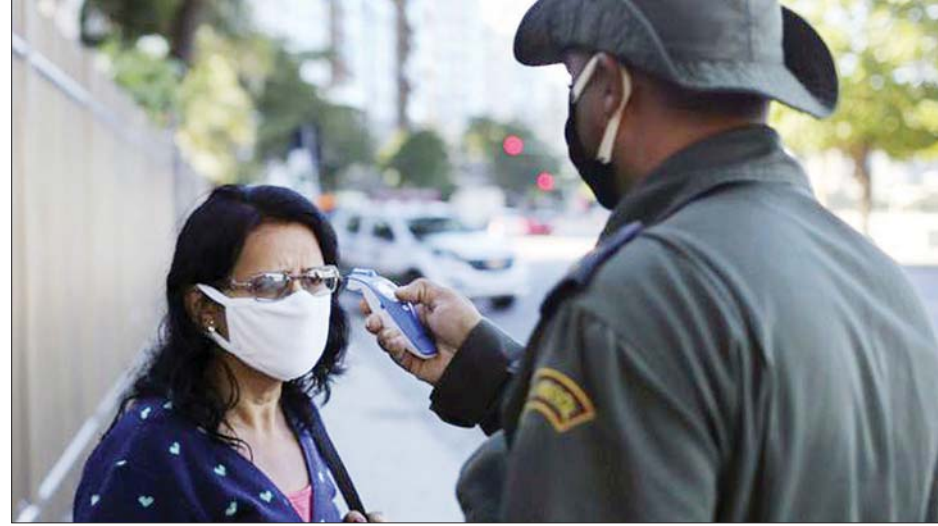
ဘရာဇီးပြည်သူတစ်ဦးကို ကိုယ်အပူချိန်တိုင်းတာနေစဉ်။