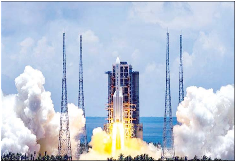
တရုတ်နိုင်ငံတောင်ပိုင်း ဟိုင်နန်ပြည်နယ်ရှိ ဝမ်ချမ်းအာကာသယာဉ်လွှတ်တင်ရေးနေရာမှ အင်္ဂါဂြိုဟ်စူးစမ်းလေ့လာရေး ယာဉ်တင်ဆောင်ထားသော လောင်းမာချီ-၅ ခုံးပျံကို လွှတ်တင်နေစဉ်။

ခုံးပျံလွှတ်တင်ပြီး ၃၆ မိနစ်ခန့် ကြာပြီးနောက် ဂြိုဟ်ပတ်လမ်းကြောင်းသွားယာဉ်တစ်စင်းနှင့် ဂြိုဟ်ပေါ်ဆင်းသက်ယာဉ်တစ်စင်းအပါအဝင် အဆိုပါအာကာသယာဉ်ကို အင်္ဂါဂြိုဟ်ပတ်လမ်းအတွင်းသို့ ပို့လွှတ်ခဲ့သည်။ အင်္ဂါဂြိုဟ်သို့ရောက်ရှိရန် ခုနစ်လနီးပါး ကြာမြင့်မည်ဖြစ်ကြောင်း တရုတ်နိုင်ငံ အမျိုးသားအာကာသစီမံခန့်ခွဲမှုဦးစီးဌာနက ပြောကြားလိုက်သည်။ တရုတ်နိုင်ငံ၏ ပထမဆုံး အင်္ဂါဂြိုဟ်ခရီးစဉ်ကို ထွန်းဝန်-၁ ဟု အမည်ပေးထားကြောင်း သိရသည်။ အဆိုပါအမည်သည် အမှန်တရားနှင့် သိပ္ပံနည်းလမ်းကို လိုက်လျောညီထွေမှုရှိစေခြင်းဖြင့် သဘာဝတရားနှင့် စကြဝဠာကို စူးစမ်းခြင်းတွင် တရုတ်နိုင်ငံ၏ ခွဲလွဲမှုကို ဖော်ပြခြင်းဖြစ်ကြောင်း တရုတ်နိုင်ငံ အမျိုးသားအာကာသစီမံခန့်ခွဲမှုဦးစီးဌာနမှ တာဝန်ရှိသူတစ်ဦးက ပြောကြားလိုက်သည်။