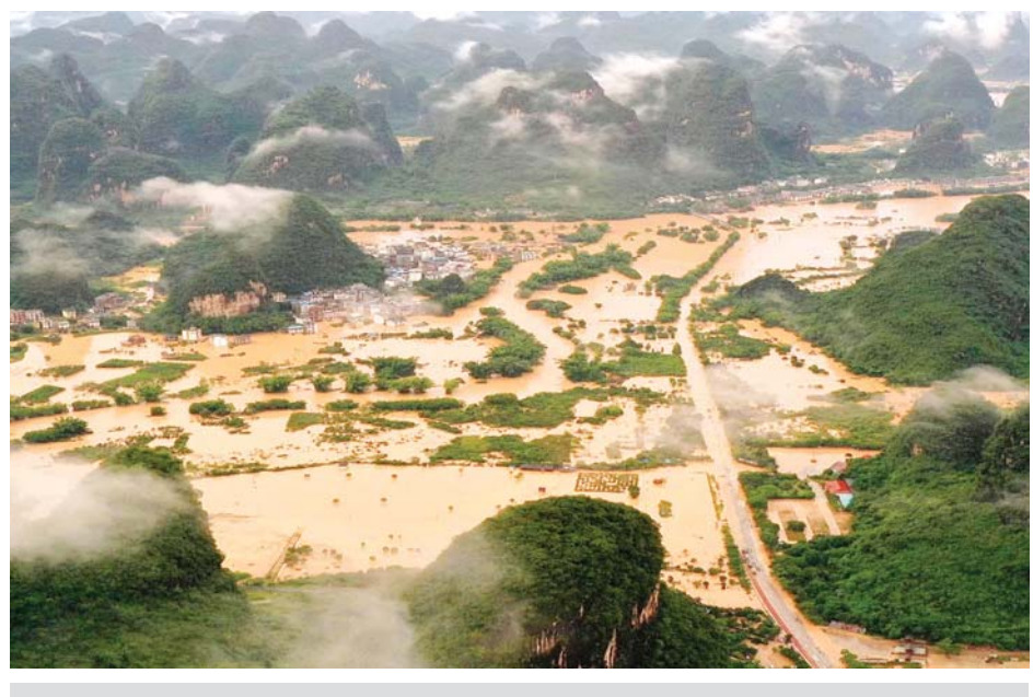
တရုတ်နိုင်ငံ ဟူဘေးပြည်နယ်၌ ရေလွှမ်းမှု ဖြစ်ပေါ်ခဲ့သည့်နေရာများကို တွေ့ရစဉ်။

ပေကျင်း ဇူလိုင် ၂၃ တရုတ်နိုင်ငံရှိ ရေဘေးသင့်စရိယာများတွင် လယ်ယာထွက်ကုန်လုပ်ငန်းများနှင့် ရေသယံဇာတ သဘာဝ ပတ်ဝန်းကျင် ထိန်းသိမ်းရေး ဆောင်ရွက်ရန် ဗဟိုအသုံးစရိတ်ထဲမှ ယွမ်သန်း ၈၃၀ (အမေရိကန်ဒေါ်လာ ၁၁၉ ဒသမ ၀၅ သန်း) ကို ရန်ပုံငွေ ခွဲဝေသတ်မှတ်လိုက်ကြောင်း ဘဏ္ဍာရေးဝန်ကြီးဌာနက ဇူလိုင် ၂၂ ရက်တွင် ဖော်ပြခဲ့သည်။ သဘာဝဘေးအန္တရာယ် ကျရောက်ပြီးနောက်ပိုင်း ပြန်လည်ထူထောင်ရေးဆောင်ရွက်ရန်နှင့် ထုတ်လုပ်ရေးလုပ်ငန်းများ ပြန်လည်ပတ်နိုင်ရန်အတွက် ကျန်ကျန်နှင့် ဟူဘေးပြည်နယ်အပါအဝင် ပြည်နယ်ပေါင်း ၁၂ ခုတို့အတွက် ရန်ပုံငွေခွဲဝေသတ်မှတ်ခြင်းဖြစ်ကြောင်း ဘဏ္ဍာရေးဝန်ကြီးဌာနက ပြောကြားသည်။ တရုတ်နိုင်ငံရှိ ရေဘေးသင့်စရိယာများတွင် ရေအရင်းအမြစ် ထိန်းသိမ်းရေးနှင့် စိုက်ပျိုးထုတ်လုပ်ရေးလုပ်ငန်းများအတွက် ယခုနှစ်ဗဟိုအသုံးစရိတ်ထဲမှ ယွမ်ငွေ ၁ ဒသမ ၂၉ ဘီလီယံအထိ ခွဲဝေသတ်မှတ်ထားကြောင်း တရားဝင်ကိန်းဂဏန်းအချက်အလက်များတွင် ဖော်ပြသည်။ ပြီးခဲ့သည့် ဇွန်လမှ စတင်ကာ တရုတ်နိုင်ငံတောင်ပိုင်းရှိ နေရာအများအပြားတွင် အဆက်မပြတ်မိုးသည်းထန်စွာရွာသွန်းမှုကြောင့် ရေနစ်မြုပ်မှုများဖြစ်ပေါ်ခဲ့ပြီး အဆိုပါဒေသများရှိ မြစ်၊ ချောင်းများတွင် စိုးရိမ်ရေမှတ်ကျော်လွန်ခဲ့သည်။ ဆင်ဟွာ