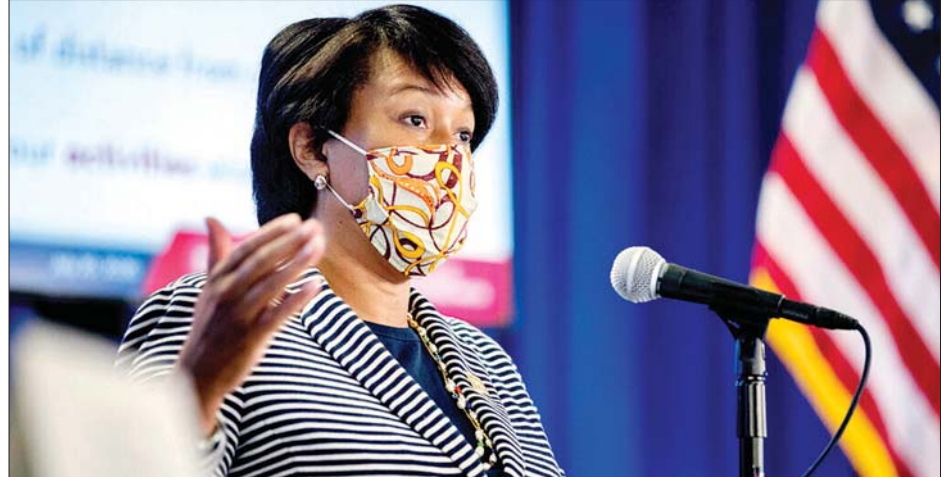
ဝါရှင်တန်မြို့တော်ဝန် မူရီရယ်ဘိုဆာ

ပြောဆိုတော့မည်ဆိုပါက အိမ်မှထွက်သည်နှင့်တစ်ပြိုင်နက် ပါးစပ်နှာခေါင်းစည်း ဝတ်ဆင်ရမည်ဖြစ်ကြောင်း မြို့တော်ဝန် မူရီရယ်ဘိုဆာ၏ ရုံးမှ ထုတ်ပြန်ကြေညာလိုက်သည်။ ဒီမိုကရက်တစ်တစ်ဦးဖြစ်သည့် ဘိုဆာသည် ဝါရှင်တန်မြို့နေပြည်သူများကို ပါးစပ်နှာခေါင်းစည်း ဝတ်ဆင်ရန် တိုက်တွန်းထားသလို နေ့စဉ်လူမှုဘဝတွင် ခပ်ခွာခွာ နေရန်လည်း တိုက်တွန်းထားသည်။ ဝါရှင်တန်သည် အမေရိကန်ပြည်ထောင်စု၏ အဓိကအရေးပါသော မြို့ကြီးတစ်မြို့ဖြစ်သည်။ ကိုဗစ်-၁၉ ဖြစ်စဉ်များ လျော့နည်းကျဆင်းလာသော်လည်း ဝါရှင်တန်သည် ကိုဗစ်-၁၉ ကို အတော်လေးသတိထား၍ တင်းကျပ်မှုများ လုပ်ဆောင်လျက်ရှိသည်။