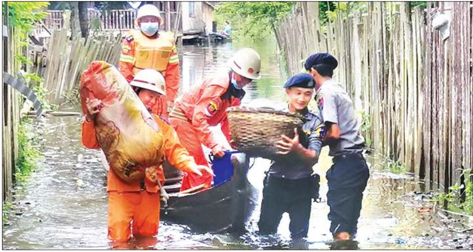
ရွှေကူမြို့နယ်ရှိ ရေဘေးသင့်နေအိမ်များမှ ပစ္စည်းများအား ကယ်ဆယ်ရေးအဖွဲ့များက ဘေးလွတ်ရာသို့ ကူညီ ရွှေ့ပြောင်းပေးစဉ်။

ထီးချိုင့်မြို့နယ်အတွင်းရှိ ရပ်ကွက် ကျေးရွာအုပ်စု များမှ တင်ပြလာသည့် စာရင်းများအရ ရေဘေးရှောင်