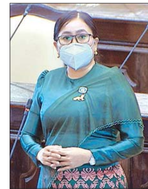
ရခိုင်ပြည်နယ် မဲဆန္ဒနယ် အမှတ်(၁၁)မှ ဒေါ်ထုမေ

အုတ်ကြွပ်ကျေးရွာကြားရှိ ပေါက်လေချောင်းကူးတံတား နှစ်စင်းတို့ကို ၂၀၂၀-၂၀၂၁ ဘဏ္ဍာရေးနှစ်တွင် ကုန်ကရစ်တံတားများအဖြစ် ဆောက်လုပ်ပေးရန် အစီအစဉ် ရှိ/မရှိ မေးခွန်းနှင့်စပ်လျဉ်း၍ နယ်စပ်ရေးရာဝန်ကြီးဌာန ဒုတိယ ဝန်ကြီး ဗိုလ်ချုပ်သန်းထွဋ်က လည်းကောင်း၊ ဧရာဝတီတိုင်းဒေသကြီး မဲဆန္ဒနယ် အမှတ်(၅)မှ ဦးမောင်မောင်အုန်း ၏ မြန်မာနိုင်ငံပိုင်မဟုတ်သော နိုင်ငံခြားမှတစ်ဆင့် တင်ထားသည့် သင်္ချာချောင်း မြန်မာနိုင်ငံအတွင်းပိုင်း ရေလမ်းကြောင်းအတွင်းသို့ တရားမဝင် သယ်ယူပို့ဆောင်ရေးလုပ်ငန်းများ ဝင်ရောက်လုပ်ကိုင်နေခြင်းကို နိုင်ငံတကာဆိုင်ရာ ဥပဒေများအရ လည်းကောင်း၊ မြန်မာနိုင်ငံ၏ ဥပဒေနှင့် လုပ်ထုံးလုပ်နည်းအရ လည်းကောင်း အမြန်ဆုံး အရေးယူဆောင်ရွက်ပေးနိုင် ခြင်း ရှိ/မရှိ နှင့် ဆောင်ရွက်မည်ဆိုပါက မည်သည့်အချိန်တွင် မည်ကဲ့သို့ ဆောင်ရွက်ပေးမည်ကို သိရှိလိုခြင်း မေးခွန်းနှင့် စပ်လျဉ်း၍ ပို့ဆောင်ရေးနှင့် ဆက်သွယ်ရေးဝန်ကြီးဌာန ဒုတိယဝန်ကြီး ဦးကျော်မျိုး ကလည်းကောင်း ပြန်လည်ရှင်းလင်းဖြေကြားခဲ့ကြသည်။