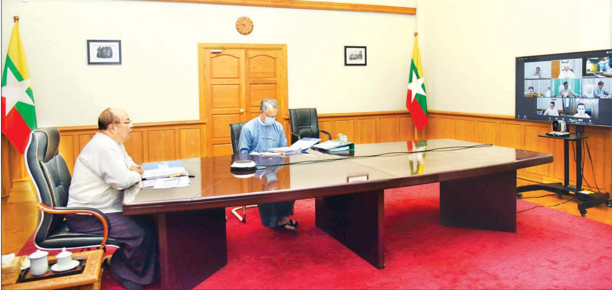
ပြည်ထောင်စုဝန်ကြီး ဦးသောင်းထွန်း ကိုဗစ်-၁၉ ကြောင့် ဖြစ်ပေါ်လာနိုင်သည့် စီးပွားရေးသက်ရောက်မှုများအပေါ် ကုစားရေးလုပ်ငန်းကော်မတီ၏ အစည်းအဝေးအမှတ်စဉ် (၇/၂၀၂၀) တွင် ဆွေးနွေးပြောကြားစဉ်။ သတင်းစဉ်

ကိုဗစ်-၁၉ ကြောင့် ဖြစ်ပေါ်လာနိုင်သည့် စီးပွားရေးသက်ရောက်မှုများအပေါ် ကုစားရေးလုပ်ငန်းကော်မတီ၏ အစည်းအဝေးအမှတ်စဉ် (၇/၂၀၂၀) ကို ယနေ့နံနက်ပိုင်းတွင် ဗီဒီယိုကွန်ဖရင့်စနစ်ဖြင့် ကျင်းပသည်။