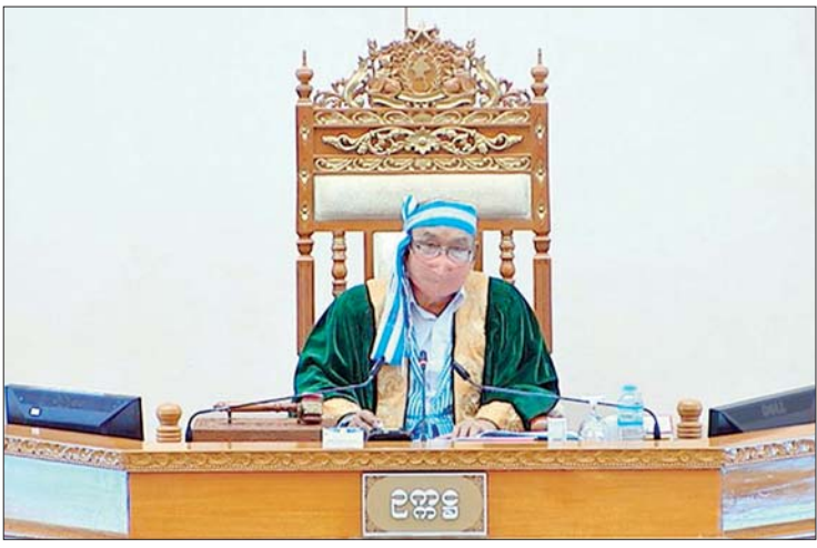
အမျိုးသားလွှတ်တော်ဥက္ကဋ္ဌ မန်းဝင်းခိုင်သန်း

အစိုးရ၏ဝယ်ယူခြင်းနှင့် ပုံသေပိုင်ပစ္စည်းများ ထုချွဲခြင်းဆိုင်ရာ ဥပဒေကြမ်းနှင့်စပ်လျဉ်း၍ ပြင်ဆင်ထားသည့်အတိုင်း အတည်ဖြစ်ကြောင်းကြေညာ