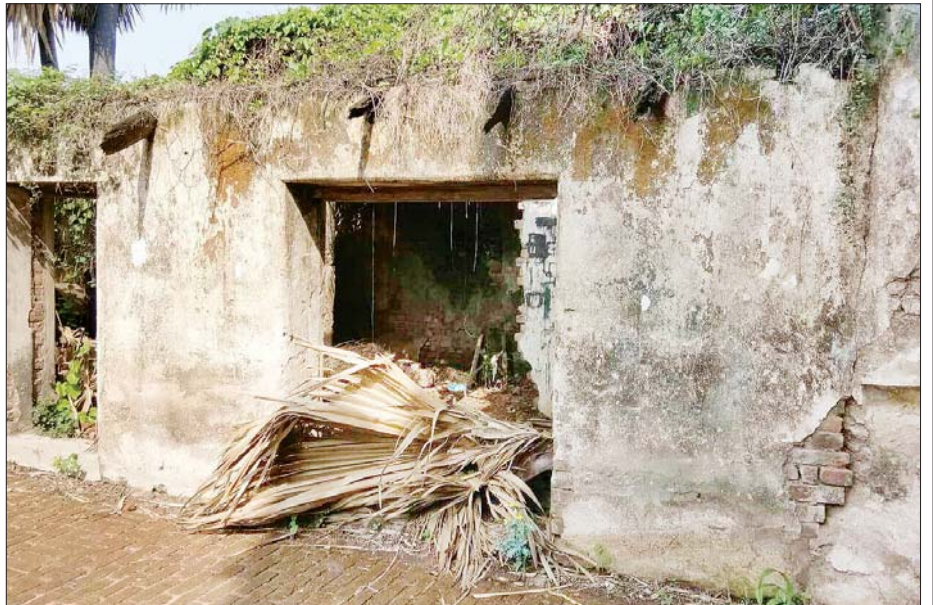
ဗုဒ္ဓဂယာမှ မင်းတုန်းမင်းတရားကြီး လှူဒါန်းခဲ့သော မပြုပြင်မီတွေ့ရသည့် သာသနိကအဆောက်အအုံများ။

“နှစ်ပေါင်း ၁၆၀ ခန့်က မင်းတုန်းမင်းကြီးသည် ဗုဒ္ဓဂယာတွင် မဟာဗောဓိစေတီနှင့် မဟာဗောဓိ ညောင်ပင်ကို စောင့်ရှောက်နိုင်ရန်ရည်ရွယ်၍ ရဟန်း တော်များ သီတင်းသုံးနေထိုင်ရန် ကျောင်းတော် တစ်ဆောင်၊ ကျောက်စာများထားရှိရန် ကျောင်းဆောင် နှစ်ဆောင်၊ ကျောက်စာချပ်နှစ်ခုနှင့် ခေါင်းလောင်း တော်များကို လှူဒါန်းခဲ့”