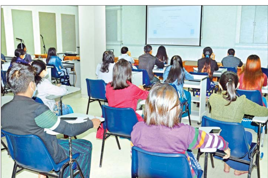
အသုံးပြုမှုများ၊ Cloud Computing IP Network ဆိုင်ရာများကို သိရသည်။ မိတ်ဆက် ဆွေးနွေးပို့ချခဲ့ကြောင်း လှဲယဉ်မြင့်

နေပြည်တော် ဇူလိုင် ၂၃ အာရုံ - ပစ်ဖိတ် ရုပ်သံလုပ်ငန်းများ အဖွဲ့အစည်း (ABU) မှ IT and Networking Basic for Broadcast Engineers သင်တန်းကို ဇူလိုင် ၂၃ ရက် နေ့လယ်ပိုင်းက Online Webinar ဖြင့် ဆွေးနွေးပို့ချရာ MRTV ရှိ စက်မှုဌာနခွဲမှ ဝန်ထမ်း ၂၁ ဦး တက်ရောက်ကြသည်။