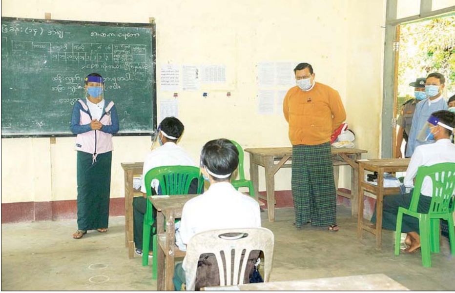
ဆိုင်ရာများ၊ ဆရာ ဆရာမများနှင့် တွေ့ဆုံခဲ့ကြောင်း သိရသည်။

ငပုတော ဇူလိုင် ၂၁ တိုင်းဒေသကြီး ကိုဗစ်-၁၉ထိန်းချုပ်ရေးနှင့် အရေးပေါ်တုံ့ပြန်ရေးကော်မတီဥက္ကဋ္ဌ ရောဂါတိုင်းဒေသကြီး ဝန်ကြီးချုပ် ဦးလှမိုးအောင်သည် စိုက်ပျိုးရေး၊ မွေးမြူရေး၊ သယံဇာတနှင့် ပတ်ဝန်းကျင်ထိန်းသိမ်းရေးဝန်ကြီးဦးတင်အောင်ဝင်း၊ လူမှုရေးဝန်ကြီးဒေါက်တာ လှမြတ်သွေး၊ ကရင်တိုင်းရင်းသားလူမျိုးရေးရာဝန်ကြီးဂျိမ်းမြတ်မြတ်သူ၊ အလုပ်သမားလူဝင်မှုကြီးကြပ်ရေးနှင့် လူ့စွမ်းအားအရင်းအမြစ် ဝန်ကြီးဒေါက်တာ စိုးဝင်းတို့နှင့်အတူ ငပုတောမြို့ အခြေခံပညာ အထက်တန်းကျောင်း ဖွင့်လှစ်နေမှုအား ယနေ့ နံနက်ပိုင်းက သွားရောက်ကြည့်ရှု စစ်ဆေးပြီး (အပေါ်ယာပုံ) မြို့နယ်အဆင့် ဌာန