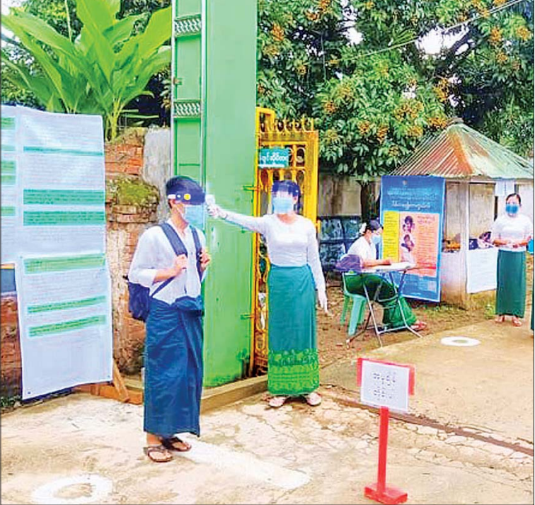
ရှမ်းပြည်နယ်အရှေ့ပိုင်း တာချီလိတ်ခရိုင် မိုင်းယောင်းမြို့နယ် အခြေခံပညာအထက်တန်းကျောင်း၌ ဇူလိုင် ၂၁ ရက်က ကိုဗစ် - ၁၉ ရောဂါ ကြိုတင်ကာကွယ်ရေးလုပ်ငန်းများနှင့်အညီ ကျောင်းသားများအား ကိုယ်ပူချိန်တိုင်းတာပေးစဉ်။ စိုင်းအောင်ဇော်လင်း(ပြန်/ဆက်)

ရန်ကုန် အနောက်ပိုင်းခရိုင် မရမ်းကုန်းမြို့နယ် အမှတ်(၂) အခြေခံပညာအထက်တန်းကျောင်း၌ ကျန်းမာရေးနှင့် အာကစားဝန်ကြီးဌာနနှင့် ပညာရေးဝန်ကြီးဌာနက ချမှတ်ထားသော လမ်းညွှန်ချက်များနှင့်အညီ ဇူလိုင် ၂၁ ရက်က အထက် တန်းကျောင်းသားများ စာသင်ကြားမှုကို တွေ့ရစဉ်။ မျိုးမင်းသိန်း (မရမ်းကုန်း)