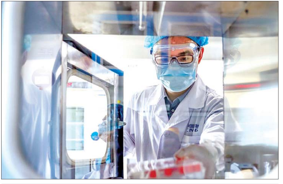
ပေကျင်းမြို့ရှိ ဆေးဝါးအဖွဲ့ (ဆီနီဖန်း)၏ ကာကွယ်ဆေးထုတ်လုပ်သောစက်ရုံတွင် ဝန်ထမ်းတစ်ဦးက ကိုပစ်-၁၉ ကာကွယ်ဆေးနမူနာများ ထုတ်ယူနေသည်ကို တွေ့ရစဉ်။

အဆိုပါအစည်းအဝေးတွင် သက်ဆိုင်ရာနိုင်ငံများမှ တာဝန်ရှိသူများက ပါဝင်ဆွေးနွေးခဲ့ကြသည်။ ဆင်ဟွာ