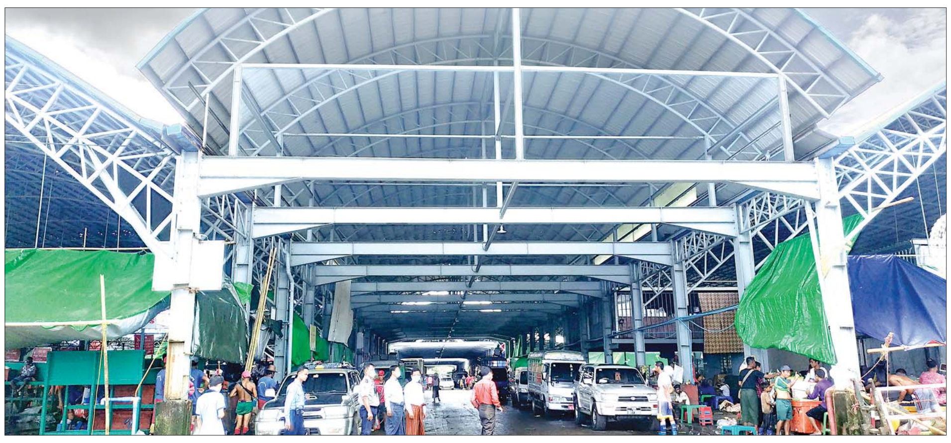
ရန်ကုန်မြို့၊ လှိုင်မြို့နယ်ရှိ ရွှေပိတောက်ငါးဈေး၌ ရောင်းဝယ်ဖောက်ကားသူများနှင့် စည်ကားနေမှုကို တွေ့ရစဉ်။