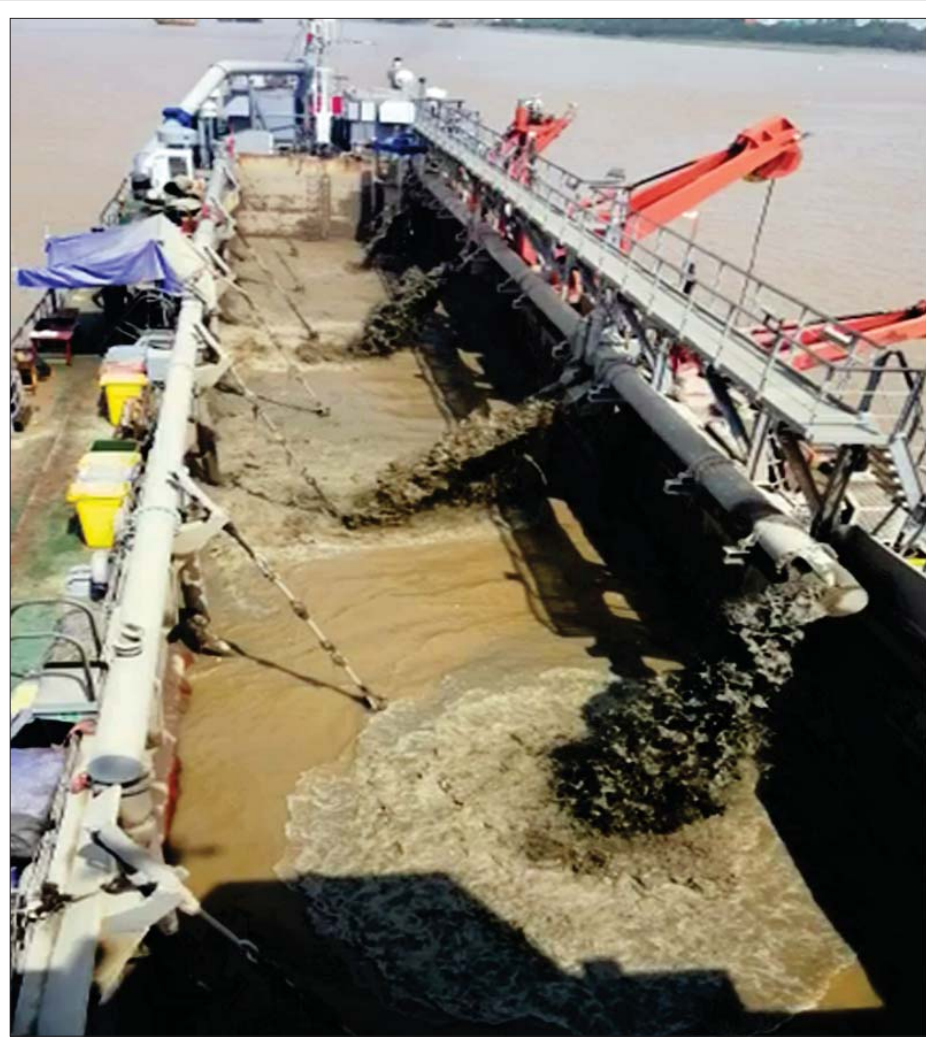
ရန်ကုန်မြစ်အတွင်း အကြီးစားသောင်တူးသင်္ဘောဖြင့် သောင်တူးဖော်ခြင်းလုပ်ငန်း ဆောင်ရွက်နေစဉ်။