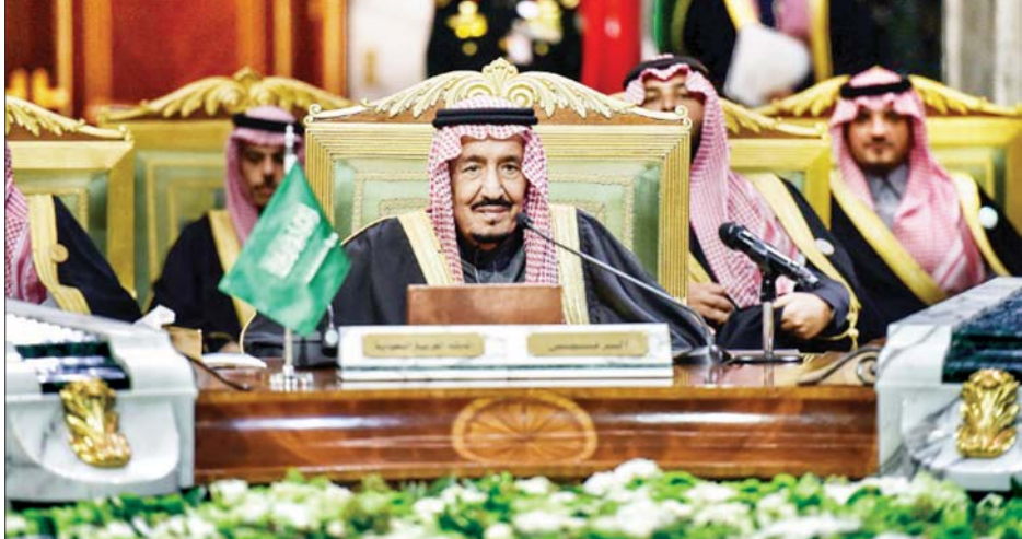
ဆော်ဒီဘုရင် ဆယ်လ်မန်ဘင်အဗ္ဗူဒူလာစစ်

ရီယာဒ် ဇူလိုင် ၂၁ ဆော်ဒီဘုရင် ဆယ်လ်မန်ဘင် အဗ္ဗူဒူလာစစ်သည် သည်းခြေအိတ် ရောင်ရမ်းမှုကြောင့် ကျန်းမာရေး စစ်ဆေးမှုခံယူရန် ဆေးရုံသို့ ရောက်ရှိ နေကြောင်း ဆော်ဒီအာရေဗျနိုင်ငံပိုင် သတင်းမီဒီယာများက ဖော်ပြသည်။ ဘုရင်ဆယ်လ်မန်ဘင်အဗ္ဗူဒူလာသည် ဇူလိုင် ၂၀ ရက်က ရီယာဒ်ရှိ ဆေးရုံသို့ တက်ရောက်ခဲ့ကြောင်း သိရသည်။ အသက် ၈၄ နှစ်ရှိပြီဖြစ်သည့် ဆော်ဒီဘုရင်သည် အိမ်နီးချင်း ဂျော်ဒန်နိုင်ငံနှင့် ဘာရိုင်းနိုင်ငံများ ၏ အကြီးအကဲများထံမှ ၎င်း၏ ကျန်းမာရေးအခြေအနေ သတင်း မေးမြန်းသည့် ဖုန်းခေါ်ဆိုမှုများကို လက်ခံဖြေကြားခဲ့သည်။ ဆော်ဒီဘုရင် ဆေးရုံသို့ တက်ရောက်ရမှုကြောင့် သံတမန် ရေးရာ အစီအစဉ်အချို့ ထိခိုက်မှုရှိခဲ့ပြီး အီရတ်ဝန်ကြီးချုပ် မူစတာဖာ အယ်လ်ခါဒီမီထံသို့ သွားရောက်မည့် ခရီးစဉ်ကိုလည်း ရွှေ့ဆိုင်းခဲ့ကြောင်း သိရသည်။