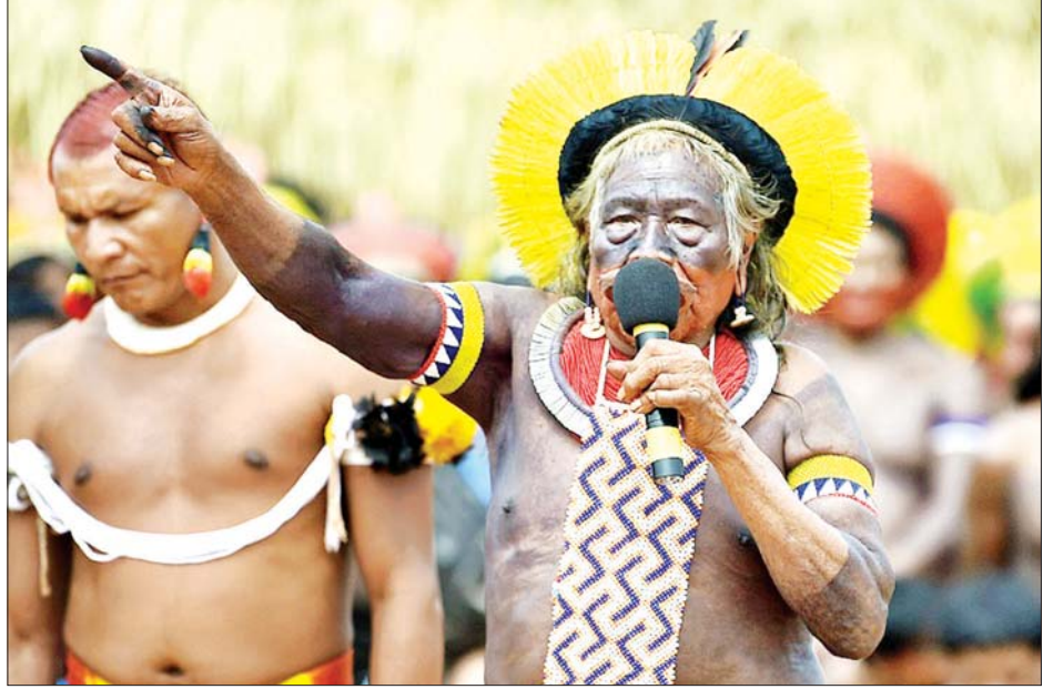
အမေရိကန်သုရဲကောင်း ဘရာဇီးလူမျိုးစုခေါင်းဆောင် ရီနိုမီတွတ်တိုင်ရာကို တွေ့ရစဉ်။