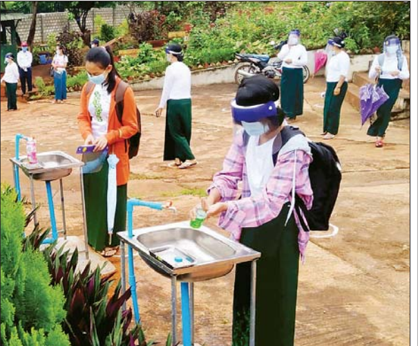
ရှမ်းပြည်နယ် မြောက်ပိုင်း ကျောက်မဲခရိုင် နမ္မတူမြို့နယ်တွင် ၂၀၂၀-၂၀၂၁ ပညာသင်နှစ် အခြေခံပညာ အထက်တန်းကျောင်းများအား ကိုဗစ်-၁၉ ရောဂါ ကာကွယ်၊ ထိန်းချုပ်ရေးဆိုင်ရာ ကျန်းမာရေးလမ်းညွှန်ချက်များနှင့်အညီ ဇူလိုင် ၂၁ ရက်က စတင်ဖွင့်လှစ်ရာ ကျောင်းသူများ လက်ဆေးနေစဉ်။