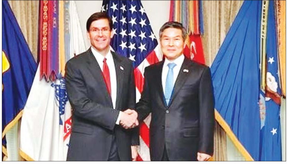
အမေရိကန်ကာကွယ်ရေးဝန်ကြီး မာ့ခ်အက်စပါနှင့် တောင်ကိုရီးယားကာကွယ်ရေးဝန်ကြီး ဂျူကျူဒု။

ထို့ပြင် အမေရိကန်နှင့် တောင်ကိုရီးယား နှစ်နိုင်ငံ နွေရာသီ ပူးတွဲစစ်ရေးလေ့ကျင့်မှုများအတွက် အချိန်သတ်မှတ်စီစဉ်မှု ဆက်လက် လုပ်ဆောင်သွားရန် ခေါင်းဆောင် နှစ်ဦးက သဘောတူခဲ့သည်။ ကိုဗစ်- ၁၉ ရောဂါ ကျရောက်မှုကြောင့် ယခုနှစ်တွင် နှစ်နိုင်ငံပူးတွဲ စစ်ရေးလေ့ကျင့်မှုများကို ရပ်နားထားခဲ့ရသည်။ ကာကွယ်ရေးဝန်ကြီး နှစ်ဦးတို့သည် ယခုနှစ်တွင် တောင်ကိုရီးယားနိုင်ငံ၌ ချထားသည့် အမေရိကန်တပ်ဖွဲ့ဝင်များ၏ အထွေထွေ ကုန်ကျစရိတ်နှင့် စပ်လျဉ်း၍ လည်း ဆွေးနွေးခဲ့ကြကြောင်း သိရသည်။ သို့ရာတွင် ယင်းဆွေးနွေးမှုနှင့် ပတ်သက်၍ အသေးစိတ်အချက်အလက်များ ဖော်ပြခဲ့ခြင်းမရှိပေ။ အမေရိကန်သမ္မတ ဒေါ်နယ် ထရမ်က တောင်ကိုရီးယားနိုင်ငံတွင် ချထားသည့် အမေရိကန်တပ်ဖွဲ့ဝင် အင်အားကို လျှော့ချရန် စဉ်းစားနေကြောင်း အမေရိကန်သတင်းစာ တစ်စောင်တွင် ဖော်ပြထားသည်။ အေအက်ဖ်ပီ