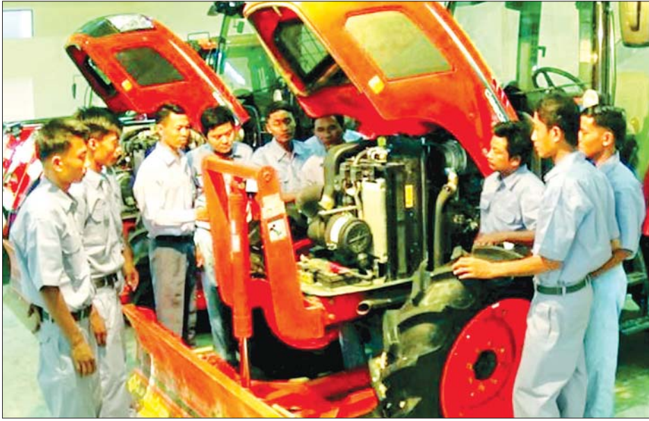
စက်ပြင်ဆင်ရေးလက်တွေ့သင်ကြားပို့ချနေပုံ

စက်မှုလယ်ယာစနစ်သို့ ကူးပြောင်းလာနိုင်သည့် အတွက် လယ်ယာလုပ်ငန်းခွင်များအတွင်း လေလွင့်ဆုံးရှုံးမှုများကိုလည်း တစ်ဖက်တွင် လျော့နည်းစေနိုင်ခဲ့ပါသည်။ ဤဆောင်းပါးတွင် လယ်ယာသုံးစက်ကိရိယာများ တိုးတက်သုံးစွဲလာသည့်အခါ တစ်နှစ်လျှင် တစ်စင်ပါဆိုသလို လိုအပ်လာသည့် စက်မှုလယ်ယာကျွမ်းကျင်လုပ်သားများ မွေးထုတ်ရေးအတွက် ဆောင်ရွက်နေမှုများကို အသိပေးတင်ပြအပ်ပါသည်။ ဦးစီးဌာနအနေဖြင့် ယင်းလုပ်သားများ မွေးထုတ်ရာတွင် လယ်ယာလုပ်ငန်းခွင်များ အဆင်ပြေချောမွေ့ရုံသာမက အလုပ်အကိုင်အခွင့်အလမ်းများ ပေါ်ပေါက်စေရေးတို့အတွက်ပါ ရည်ရွယ်ပြီး နိုင်ငံတကာအသိအမှတ်ပြုကျွမ်းကျင်လက်မှတ်များ ရရှိစေရေးအတွက် မြန်မာနိုင်ငံလုပ်သားများ ကျွမ်းကျင်မှုစံသတ်မှတ်ပြဋ္ဌာန်းရေးအဖွဲ့ (NSSA) နှင့် ပူးပေါင်းဆောင်ရွက်လျက်ရှိပါသည်။ လက်ရှိတွင် စက်မှုလယ်ယာဦးစီးဌာနအနေဖြင့် စက်မှုလယ်ယာ သင်တန်းကျောင်းများ၊ စက်မှုလယ်ယာစက်ပြင် အလုပ်ရုံများနှင့် တိုင်းဒေသကြီးနှင့် ပြည်နယ်အသီးသီးရှိ စက်မှုလယ်ယာစခန်းများတွင် လယ်ယာသုံးစက်ကိရိယာ မောင်းနှင်ထိန်းသိမ်းမှု သင်တန်းများ၊ လယ်ယာသုံးစက်ကိရိယာ စက်ပြင်