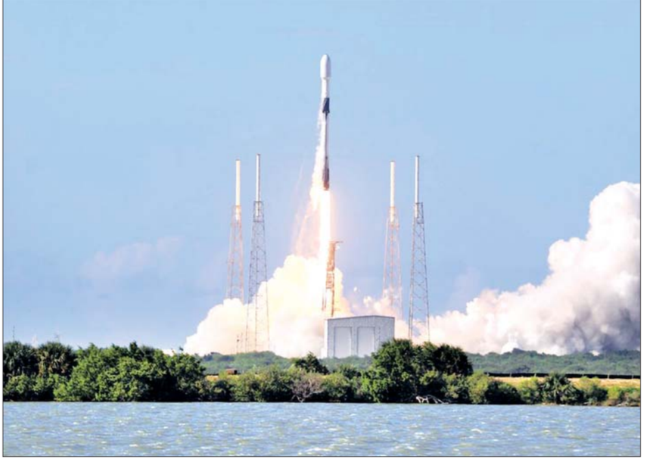
စပေ့စ်အိတ်စ်၏ ဖယ်ကွန်-၉ ခုံးပျံကို ဖလော်ရီဒါရှိ ကိတ်ကာနေဗာရယ် လေတပ်အခြေစိုက်စခန်းမှ လွှတ်တင်လိုက်သည်ကို တွေ့ရစဉ်။