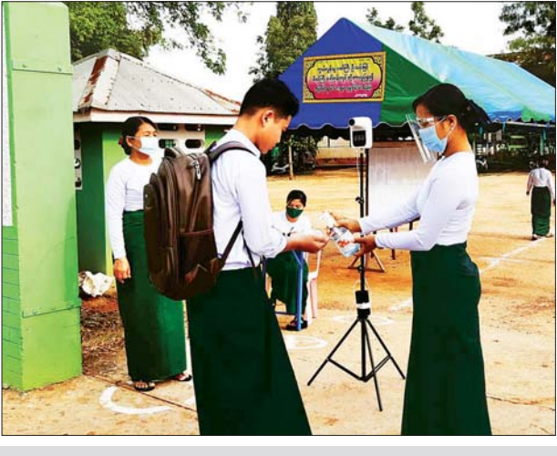
တနင်္သာရီတိုင်းဒေသကြီး ကော့သောင်းမြို့နယ်အတွင်း အစိုးရအခြေခံပညာ အထက်တန်းကျောင်း ကိုးကျောင်း၊ အထက်တန်းကျောင်း(ခွဲ)ငါးကျောင်း၊ ကိုယ်ပိုင် အထက်တန်းကျောင်း တစ်ကျောင်းရှိရာ ဇူလိုင် ၂၁ ရက်က ကျန်းမာရေးနှင့် အာကစားဝန်ကြီးဌာန၏ လမ်းညွှန်ချက်နှင့်အညီ အစိုးရအထက်တန်းအဆင့် ကျောင်းပေါင်း ၁၄ ကျောင်း ပြန်လည်ဖွင့်လှစ်ပြီး ကျောင်းသားများ ကျောင်းအတွင်း မဝင်မီ လက်သန့်ဆေးဖျန်းပေးစဉ်။