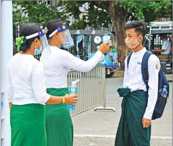
မန္တလေးမြို့တွင် ၂၀၂၀-၂၀၂၁ ပညာသင်နှစ်အတွက် အခြေခံပညာအထက်တန်းကျောင်းများအား ကိုဗစ် - ၁၉ ရောဂါ ကာကွယ်ရေး လမ်းညွှန်ချက်များနှင့်အညီ ဇူလိုင် ၂၁ ရက်က ဖွင့်လှစ်ရာ ကျောင်းသား ကျောင်းသူများအား ဆရာမများက ကိုယ်ပူချိန်တိုင်းတာပေးစဉ်။

အထူးဂရုပြုစေလိုကြောင်း၊ အခက်အခဲများကိုသက်ဆိုင်ရာအစိုးရအဖွဲ့နှင့် ပညာရေး၊ ကျန်းမာရေးဌာနများသို့ အချိန်မရွေး အကူအညီ တောင်းခံနိုင်ကြောင်း ပြောကြားသည်။ ဆက်လက်၍ တိုင်းဒေသကြီး ပညာရေးဗဟိုကလောင်ဆောင်ရွက်မှုအခြေအနေများနှင့် ငပုတောမြို့ အခြေခံပညာ အထက်တန်းကျောင်းတာဝန်ခံကျောင်းအုပ်ကြီးက ကျောင်းသားများ လက်ခံထားမှုအခြေအနေများ၊ ကျန်းမာရေးနှင့် အာကစားဝန်ကြီးဌာနက ထုတ်ပြန်ထားသည့် ညွှန်ကြားချက်များနှင့်အညီ ဆောင်ရွက်မှုအခြေအနေများကို ရှင်းလင်းတင်ပြကြပြီး တိုင်းဒေသကြီး ဝန်ကြီးချုပ်က လိုအပ်သည်များ မှာကြားကြောင်း သိရသည်။ လှမင်းထွဋ်(ပြန်/ဆက်)