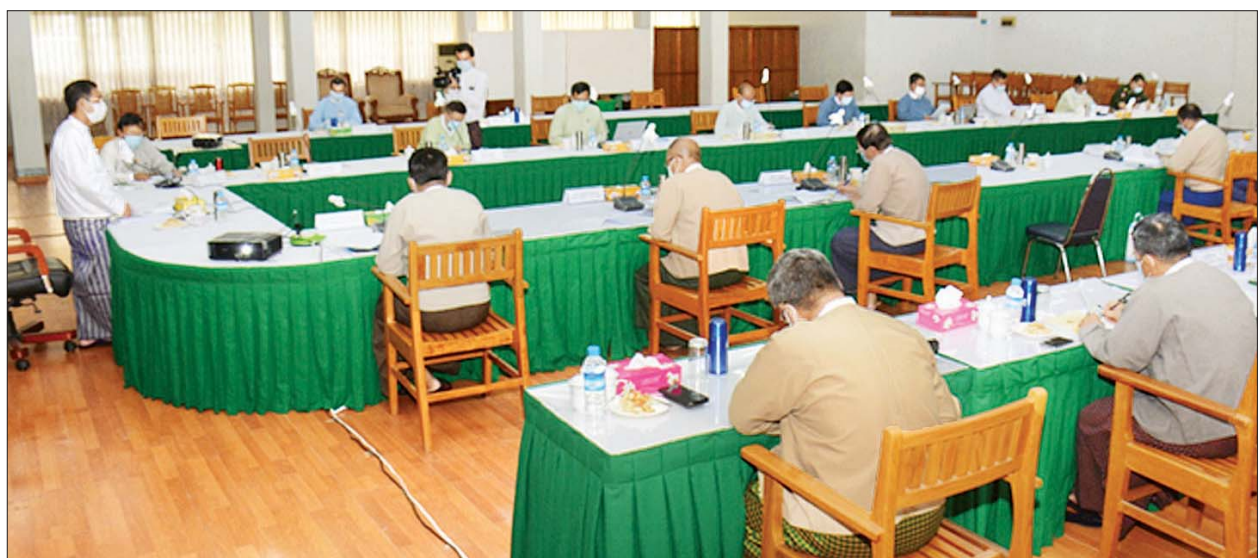
ပြည်ထောင်စုဝန်ကြီး ဒေါက်တာအောင်သူ မြေလွတ်၊ မြေလပ်နှင့် မြေရိုင်းများ စီမံခန့်ခွဲရေးဗဟိုကော်မတီ၏ (၂၈) ကြိမ်မြောက် လုပ်ငန်းညှိနှိုင်းအစည်းအဝေးတွင် အမှာစကားပြောကြားစဉ်။

နိုင်ငံတော် ဖွံ့ဖြိုးတိုးတက်ရေးအတွက် စီးပွားဖြစ် စိုက်ပျိုးရေး၊ မွေးမြူရေး၊ ဓာတ်သတ္တုထုတ်လုပ်ခြင်းလုပ်ငန်းများ၊ အစိုးရက ခွင့်ပြုထားသော ဥပဒေနှင့် ညီညွတ်သည့် အခြားလုပ်ငန်းများအား မြေလွတ်၊ မြေလပ်နှင့် မြေရိုင်းများကို အသုံးပြု၍ ထိရောက်မှုကန်စွာ အသုံးပြုလုပ်ကိုင်နိုင်ကြစေရန် မြေလွတ်၊ မြေလပ်နှင့် မြေရိုင်းများ စီမံခန့်ခွဲရေးဗဟိုကော်မတီအဖွဲ့က မြေလွတ်၊ မြေလပ်