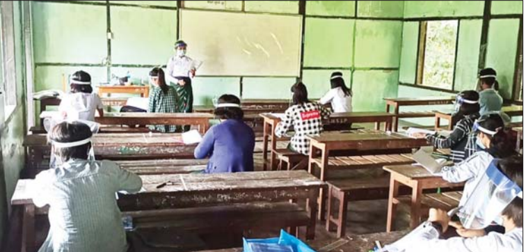
စစ်ကိုင်းတိုင်းဒေသကြီး ကလေးမြို့နယ်တွင် အထက်တန်းအဆင့် ကျောင်းများကို ကျန်းမာရေးနှင့် အာကစားဝန်ကြီးဌာနမှ ထုတ်ပြန်ထားသော ကိုဗစ် - ၁၉ စည်းကမ်းချက်များနှင့်အညီ ဖွင့်လှစ်ပြီး စာသင်ကြားမှုကို တွေ့ရစဉ်။