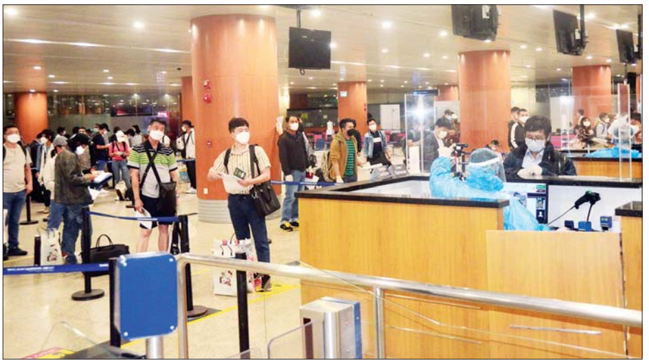
ကိုရီးယားသမ္မတနိုင်ငံမှ ပြန်လည်ရောက်ရှိလာသည့် မြန်မာနိုင်ငံသားများကို တွေ့ရစဉ်။