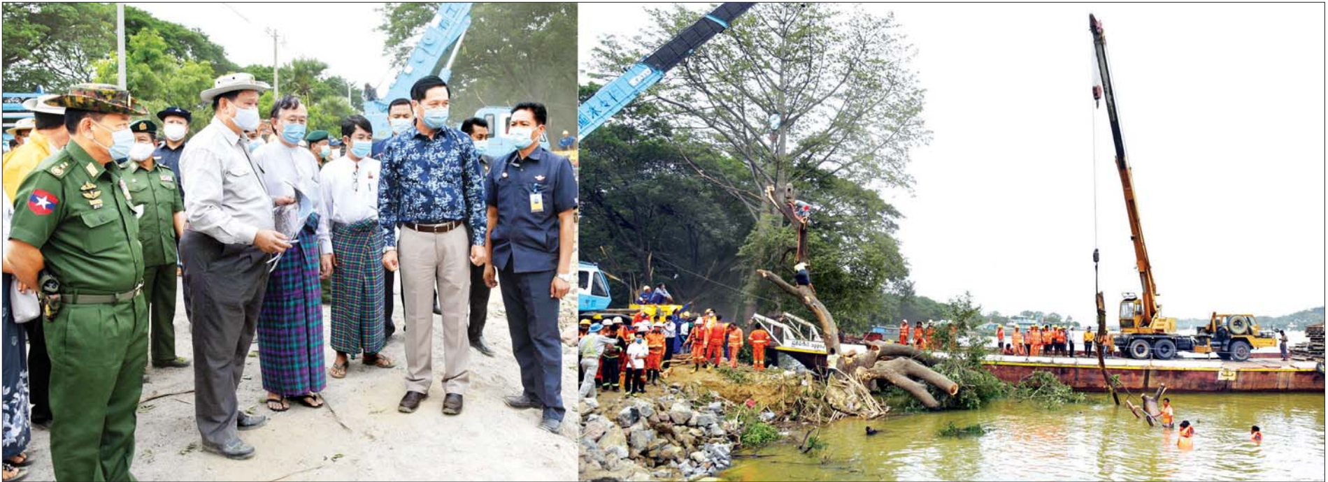
ဒုတိယသမ္မတ ဦးဟင်နရီဗန်ထီးယူ အမရပူရမြို့နယ် ရွှေဂဲရေဆိုးထုတ်စက်ရုံအနီး တာရီးကျိုးပေါက်မှုကြောင့် ဧရာဝတီမြစ်ရေဝင်ရောက်မှုအား တားဆီးပိတ်ဆို့နိုင်မှုနှင့် ကမ်းနားလမ်း ပြန်လည်တည်ဆောက်ပြီးစီးမှု အခြေအနေများကို ကြည့်ရှုစဉ်။ သတင်းစဉ်

ဒုတိယသမ္မတ ဦးဟင်နရီဗန်ထီးယူ အမရပူရမြို့နယ် ရွှေဂဲရေဆိုးထုတ်စက်ရုံအနီး တာရီးကျိုးပေါက်မှုကြောင့် ဧရာဝတီမြစ်ရေဝင်ရောက်မှုအား တားဆီးပိတ်ဆို့နိုင်မှုနှင့် ကမ်းနားလမ်း ပြန်လည်တည်ဆောက်ပြီးစီးမှု အခြေအနေများ သွားရောက်ကြည့်ရှု