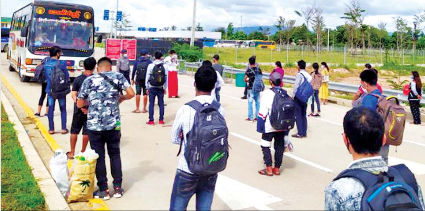
မြဝတီအမှတ်(၂) ချစ်ကြည်ရေးတံတားမှ မြန်မာလည်ဝင်ရောက်လာသည့် မြန်မာနိုင်ငံသားများကို တွေ့ရစဉ်။