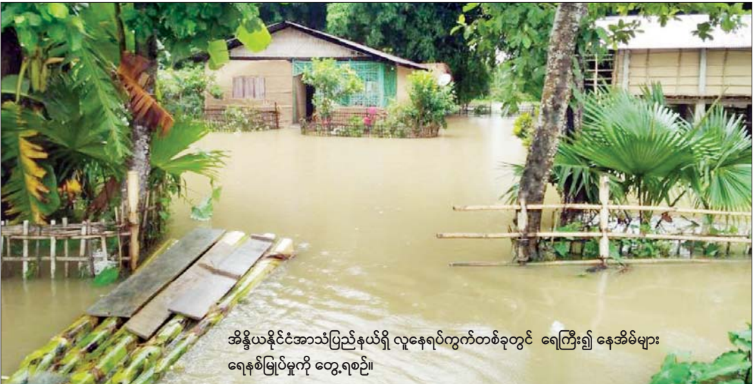
အိန္ဒိယနိုင်ငံအာသံပြည်နယ်ရှိ လူနေရပ်ကွက်တစ်ခုတွင် ရေကြီး၍ နေအိမ်များ ရေနစ်မြုပ်မှုကို တွေ့ရစဉ်။

နယူးဒေလီ ဇူလိုင် ၂၁ အိန္ဒိယနိုင်ငံ၌ မိုးရာသီကာလအတွင်း အရှိန်အဟုန် ကောင်းစွာ မိုးရွာသွန်းမှုကြောင့် နိုင်ငံတစ်ဝန်း ရေကြီးမှုများ ဖြစ်ပွားလျက်ရှိပြီး မုတ်သုံရာသီဝင်ချိန်မှ စတင်ကာ အာသံပြည်နယ်၌ လူ ၈၀ ထက်မနည်း သေဆုံးခဲ့ကြောင်း သိရသည်။ အိန္ဒိယနိုင်ငံတစ်ဝန်း၌ ကိုဗစ်- ၁၉ ရောဂါကူးစက်ဖြစ်ပွားမှုကို အလူးအလဲရင်ဆိုင်နေရချိန်တွင် မိုးသည်းထန်စွာ ရွာသွန်းမှုကြောင့် ရေကြီးမှုက ပြည်သူများအား ထပ်မံဖိစီးနှိပ်စက်လျက်ရှိသည်။ ကျေးရွာအချို့ ရေနစ်မြုပ်ခဲ့ပြီး အာသံပြည်နယ်ရှိ နေအိမ်ပေါင်းထောင်ချီ ရေထဲကျကျ ပျက်စီးခဲ့ကြောင်း ဒေသအာဏာပိုင်များက ပြောသည်။ အိန္ဒိယပြည်သူ ၂ ဒသမ ၃ သန်းအထိ ရေဘေးသင့်လျက်ရှိကြောင်း သိရသည်။ အာသံပြည်နယ်တွင် ပြီးခဲ့သည့်မေလကတည်းက ရေကြီးမှုသုံးကြိမ်တိုင်တိုင် ဖြစ်ပွားခဲ့သော်လည်း နောက်ထပ်သုံးလကြာသည်အထိ မုတ်သုံမိုးဆက်လက်ရွာသွန်းဖွယ်ရှိကြောင်း သိရသည်။ အိမ်နီးချင်းနိုင်ငံများတွင်လည်း မိုးသည်းထန်စွာရွာသွန်းမှုကြောင့် ထိခိုက်မှုများရှိပြီး ဘင်္ဂလားဒေ့ရှ်နိုင်ငံတွင် ပြည်သူတစ်သန်းကျော် ရေဘေးသင့်နေကြောင်း ဘင်္ဂလားဒေ့ရှ်သတင်း မီဒီယာများတွင် ဖော်ပြသည်။ ထို့ပြင် အိမ်နီးချင်း နီပေါနိုင်ငံတွင် ရေကြီးမှုနှင့် မြေပြိုမှုများကြောင့် သေဆုံးသူ ၁၃၄ ဦးရှိကြောင်း သိရသည်။ အင်န်အိတ်ချီက