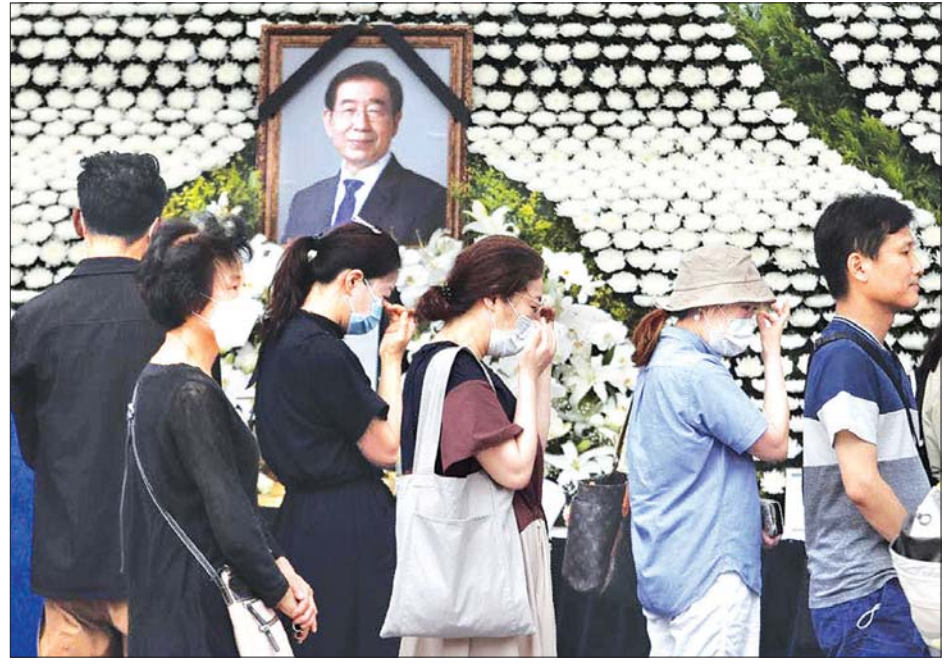
ဆိုးမြို့တော်ဝန်၏ ဈာပနပွဲကို တက်ရောက်လာကြသူများအား တွေ့ရစဉ်။