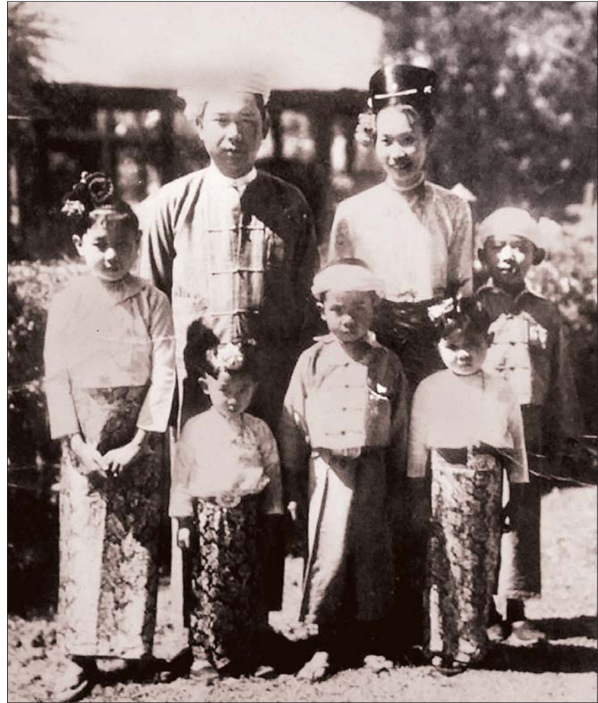
မိုင်းပွန်စော်ဘွားကြီးစစ်ထွန်းနှင့် မိသားစုဝင်များ၏ မှတ်တမ်းဓာတ်ပုံ။

ကိုလိုနီခေတ် မြန်မာ့လွတ်လပ်ရေးကြိုးပမ်းမှု နောက်ဆုံးအဆင့် တောင်တန်းနှင့် ပြည်မပူးပေါင်းရေး၊ တိုင်းရင်းသားစည်းလုံးညီညွတ်ရေး၊ ပြည်ထောင်စုတည်ထောင်ရေးတို့အတွက် အရေးပါလှသော သမိုင်းဝင် "ပင်လုံစာချုပ်"ကို လက်မှတ်ရေးထိုးသူများတွင် တစ်ဦးအပါအဝင် ဖြစ်သည်။ ပင်လုံစာချုပ်ချုပ်ဆိုအပြီး ပထမဆုံးသော တောင်တန်းဒေသ ဝန်ကြီးအဖြစ် ရွေးချယ်ခံရသည်။ ဗိုလ်ချုပ်အောင်ဆန်းဦးဆောင်သော ကြားဖြတ် ယာယီအမျိုးသားအစိုးရအဖွဲ့တွင် တောင်တန်းဒေသရေးရာ ဝန်ကြီးအဖြစ် တာဝန်ထမ်းဆောင်နေစဉ် ၁၉၄၇ ခုနှစ် ဇူလိုင်လ ၁၉ ရက် ရန်ကုန်မြို့ အတွင်းဝန်များရုံး၌ ဝန်ကြီးများ အစည်းအဝေး ပြုလုပ်နေစဉ် မသမာသူလူတစ်စု၏ လုပ်ကြံမှုဖြင့် ဗိုလ်ချုပ်နှင့်အတူ ကျဆုံးခဲ့ရသည်။ လူသတ်သမား၏ သေနတ်ဒဏ်ရာဖြင့် ဇူလိုင်လ ၂၀ ရက်နေ့ မွန်းတည့် ၁၂ နာရီတွင် ကွယ်လွန်ခဲ့ပါသည်။ လုပ်ကြံမှုမတိုင်မီ ဇူလိုင်လ ၁၈ ရက် ညတွင် ရန်ကုန်မြို့ ရွှေတောင်ကြားရပ် လောင်းဝစွလမ်း မြန်မာ့အသံ ညွှန်ကြားရေးဝန် ဦးခင်စော(K)ထံ ခေတ္တပြောင်းရွှေ့နေသော ပြန်ကြားရေးဌာနဝန်ကြီး ဒီးဒုတ်ဦးဘချိုထံ လာရောက်လည်ပတ်ရင်း မြန်မာ့အသံ ဝန်ထမ်း ဦးဖေသော်၏ဇနီး ရှမ်းအမျိုးသမီး ဒေါ်လှထယ်အား မိုင်းပွန် စော်ဘွားကြီးက "ငါတော့ ဝန်ကြီးလုပ်ပြီး ပြေးနေတာနဲ့ အပစ်ခံရတာထက် ကိုယ့်သတ္တုတွင်းမှာပဲ သတ္တုတူးသမား လုပ်နေချင်တော့တယ်" ဟု နောက်ဆုံး ပြောခဲ့ပါသည်။