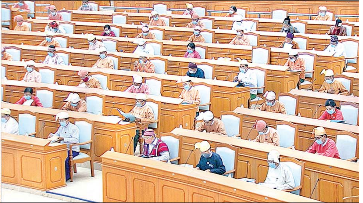
ဒုတိယအကြိမ် ပြည်ထောင်စုလွှတ်တော် (၁၇)ကြိမ်မြောက် ပုံမှန်အစည်းအဝေးကျင်းပစဉ်။