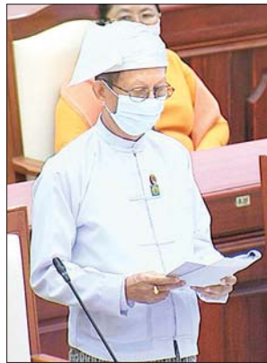
ဒုတိယဝန်ကြီး ဦးသာဦး

ပေါက်တော မဲဆန္ဒနယ်မှ ဦးအောင်ကျော်၏ ပေါက်တောမြို့နယ်၊ ပင်လယ် ကမ်းစပ်ဒေသအချို့တွင် တယ်လီဖုန်းဆက်သွယ်ရေး ကောင်းမွန်လာအောင် မည်သို့စီမံဆောင်ရွက်ပေးမည်ကို သိလိုခြင်းမေးခွန်းနှင့်စပ်လျဉ်း၍ ဒုတိယ ဝန်ကြီး ဦးသာဦးက ဆက်သွယ်ရေးအော်ပရေတာများအနေဖြင့် လွှတ်တော်