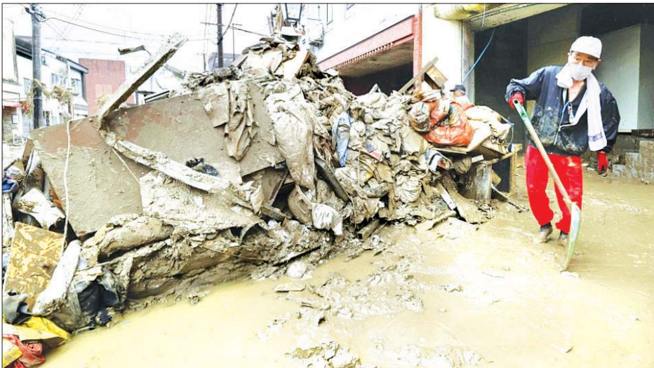
ရေလွှမ်းမှုဖြစ်ပေါ်ခဲ့သည့် ဟီတိုရှိမြို့တွင် ရွံ့များဖယ်ရှားနေသည့် အမျိုးသားတစ်ဦးကို ဇူလိုင် ၉ ရက်က တွေ့ရစဉ်။

တိုကျို ဇူလိုင် ၁၃ ဂျပန်နိုင်ငံတွင် လာမည့်ရက်များ၌ မိုးသည်းထန်စွာ ရွာသွန်းမှုကြောင့် အပျက်အစီး များလာနိုင်ကြောင်း မျှော်လင့်ထားကြသည်။ ဂျပန်နိုင်ငံ အရှေ့ပိုင်းနှင့် အနောက်ပိုင်းရှိ ပြည်သူများအနေဖြင့် မြေပြိုမှုနှင့် ရေကြီးမှုများကို သတိထားကြရန် မိုးလေဝသဌာနက တိုက်တွန်းထားသည်။ သဘာဝဘေး အန္တရာယ်ကို ဆိုးရွားစွာခံစားခဲ့ရသည့် ကျွန်ုပ်တို့ဒေသ တစ်ဝိုက်တွင်မူ ရာသီဥတုပိုမိုကောင်းမွန်လာသည်။ ပျက်စီးဆုံးရှုံးမှုများကြား ကယ်ဆယ်ရေးအဖွဲ့များကလည်း အသက်ရှင်ကျန်ရစ်သူများကို ရှာဖွေခဲ့ကြသည်။ သဘာဝဘေးအန္တရာယ် ထိခိုက်ခံစားရာဒေသတွင် လူပေါင်း ၇၀ ကျော် အသက်ဆုံးရှုံးခဲ့ရပြီး ၁၃ ဦးမှာ ပျောက်ဆုံးနေဆဲဖြစ်သည်။ အချို့သော ဒေသများတွင်မူ ရေကြီးမှုကြောင့် လမ်းများ၊ တံတားများ ပျက်စီးဆုံးရှုံးသွားသည့်အတွက် ပျက်စီးဆုံးရှုံးမှုများကို တွက်ချက်ရန် မဖြစ်နိုင်သေးပေ။ ဇူလိုင် ၁၄ ရက်အထိ မိုးဆက်လက်ရွာသွန်းနိုင်ပြီး