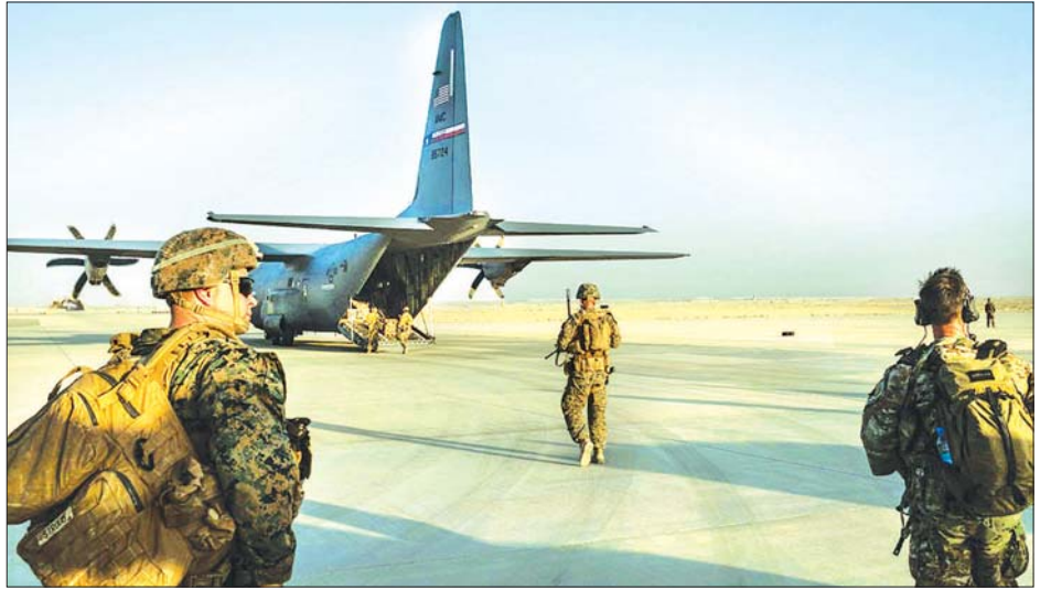
အာဖဂန်နစ္စတန်နိုင်ငံ ရာဘတ်စခန်းတွင် လွန်ခဲ့သောနှစ်က တာဝန်ထမ်းဆောင်ခဲ့သော အမေရိကန်တပ်ဖွဲ့ဝင်များ ကိုတွေ့ရစဉ်။

၁၃၀၀၀ မှ ၈၆၀၀ အထိ လျှော့ချသွားရန် သဘောတူထား သည်။ ယင်းသို့ တပ်ဖွဲ့ဝင်အင်အား လျှော့ချခြင်းသည် အမေရိကန် သမ္မတ ထရမ်၏ မဲဆွယ်စည်းရုံးမှု ကတိများ ထဲမှ တစ်ခုဖြစ်သည်။ အာဖဂန်နစ္စတန်ရှိ အမေရိကန် ပြောရေးဆိုခွင့်ရှိသူက တပ်ဖွဲ့ ဝင်အင်အားလျှော့ချခြင်းလုပ်ငန်း ပြီးစီးသွားပြီဟု အင်န်အိတ်ချ်ကေသို့ ပြောသည်။ ငြိမ်းချမ်းရေးသဘောတူညီမှုအရ ကျန်ရှိနေသေးသည့် အမေရိကန် တပ်ဖွဲ့ဝင်များသည် ၁၄လအတွင်း အာဖဂန် မြေမှ ထွက်ခွာသွားရမည်ဖြစ်သည်။ သို့သော်လည်း တာလီဘန်များသည် အာဖဂန်လုံခြုံ ရေးတပ်ဖွဲ့ဝင်များကို တိုက်ခိုက်မှုများပြုလုပ်နေသည့် အတွက် ငြိမ်းချမ်းရေးမှာ အစစ်အမှန် အကောင်အထည် ဖော်နိုင်ခြင်း ရှိ မရှိ ပြောနိုင်ရန် မသေချာပေ။ ဇွန်လနှောင်းပိုင်းမှ စတင်ကာ မြောက်ပိုင်းဘက်က လန်ပြည်နယ်တွင် တိုက်ပွဲများပြင်းထန်ခဲ့ပြီး လုံခြုံရေး တပ်ဖွဲ့ဝင်များ အပါအဝင် လူပေါင်း ၂၉၀ အထိ သေဆုံး ခဲ့ကြောင်း သိရသည်။ အင်န်အိတ်ချ်ကေ