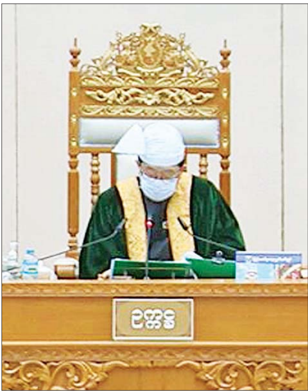
ပြည်သူ့လွှတ်တော်ဥက္ကဋ္ဌ ဦးတီခွန်မြတ်

ကျောက်ဖြူမဲဆန္ဒနယ်မှ ဦးဘရှိန်၏ နိုင်ငံရေးပါတီတစ်ခုခုကို ကိုယ်စားပြု သည့် ပါတီဝင်တစ်ဦးသည် သက်ဆိုင်ရာပါတီ၏ စည်းမျဉ်းများနှင့်အညီ ပါတီဝင်ဖြစ်ခြင်း၊ နုတ်ထွက်ခြင်း၊ ထုတ်ပယ်ခြင်း၊ ပါတီဝင်အဖြစ်မှ ရပ်စဲခြင်းတို့ကို လိုက်နာရသည်ကို သိရှိပါသလား၊ ပါတီတစ်ခုခုကို ကိုယ်စားပြုသည့် ပါတီဝင် တစ်ဦးသည် အခြားပါတီဝင်အဖြစ်ဖြင့် ကိုယ်စားပြုပြီး ရွေးကောက်ပွဲများ၌ ဝင်ရောက်ယှဉ်ပြိုင်လျှင် နိုင်ငံရေးပါတီများမှတ်ပုံတင်ခြင်း ဥပဒေပုဒ်မ ၂၁ ပါ ပြဋ္ဌာန်းချက်နှင့် ဆန့်ကျင်သည် မဟုတ်ပါလားဆိုသည်ကို သိလိုခြင်းမေးခွန်းနှင့် စပ်လျဉ်း၍ ပြည်ထောင်စုရွေးကောက်ပွဲကော်မရှင်အဖွဲ့ဝင် ဦးသက်ထွန်းက ရွေးကောက်ပွဲဥပဒေ ပုဒ်မ ၉ တွင် ရွေးကောက်တင်မြောက်ခံပိုင်ခွင့်ရှိသူ တစ်ဦး သည် တစ်သီးပုဂ္ဂလအဖြစ်ဖြင့်ဖြစ်စေ၊ နိုင်ငံရေးပါတီတစ်ခုခုကို ကိုယ်စားပြု၍ ဖြစ်စေ ရွေးကောက်ပွဲတွင် ဝင်ရောက်ယှဉ်ပြိုင်ခွင့်ရှိသည်ဟု ပြဋ္ဌာန်းထားပါ ကြောင်း၊ နိုင်ငံရေးပါတီများမှတ်ပုံတင်ခြင်းဥပဒေ ပုဒ်မ ၂၁ ပါ ပြဋ္ဌာန်းချက်အရ ပုဂ္ဂိုလ်တစ်ဦးသည် တစ်ချိန်တည်းတွင် ပါတီတစ်ခုသာ ပါဝင်ဆောင်ရွက်ခွင့် ရှိသည့်အတွက် ပါတီတစ်ခုခု နုတ်ထွက်ခွင့်မရရှိသော ပုဂ္ဂိုလ်တစ်ဦးသည် အခြားနိုင်ငံရေးပါတီတစ်ခုခုကို ကိုယ်စားပြု၍ ဝင်ရောက်ယှဉ်ပြိုင်မည်ဆိုပါက နိုင်ငံရေးပါတီများ မှတ်ပုံတင်ခြင်း ဥပဒေပုဒ်မ ၂၁ ပါ ပြဋ္ဌာန်းချက်နှင့် ဖြစ်နိုင်ပါ ကြောင်း၊ သို့ရာတွင် ယင်းသို့ ပါတီမှ နုတ်ထွက်ခွင့်မရသည့် အခြေအနေတွင် ၎င်း၏ ရွေးကောက်တင်မြောက်ခံပိုင်ခွင့် မဆုံးရှုံးစေရေးအတွက် တစ်သီးပုဂ္ဂလ အဖြစ် ဝင်ရောက်ယှဉ်ပြိုင်ပါက နိုင်ငံရေးပါတီများမှတ်ပုံတင်ခြင်း ဥပဒေပုဒ်မ ၂၁ ပါ ပြဋ္ဌာန်းချက်နှင့်ဆန့်ကျင်သည်ဟု ဆိုနိုင်မည်မဟုတ်ပါကြောင်း ရှင်းလင်း ဖြေကြားသည်။