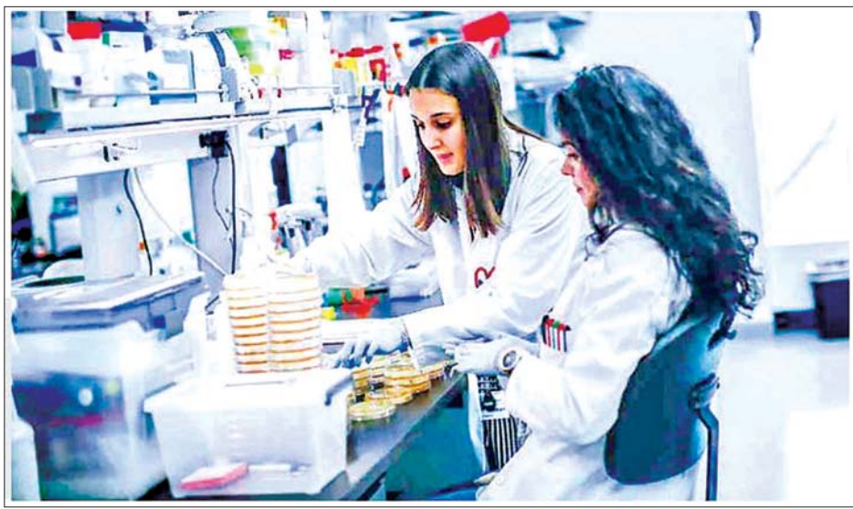
ကိုဗစ် - ၁၉ အကြောင်း စူးစမ်းလေ့လာနေကြသည့် သုတေသီများကို ဖေဖော်ဝါရီ ၂၈ ရက်က တွေ့ရစဉ်။

ပေါ်ပေါက်လာနိုင်ကြောင်း အောက်စဖို့ဒ် ဆေးပညာဆိုင်ရာ အချက်အလက်စင်တာမှာ တွဲဖက်နည်းပြတစ်ဦးဖြစ်သူ တွမ်ဂျက်ဖာဆင်က ယခုလအစောပိုင်းတွင် ပြောသည်။ စပိန်ရောဂါဗေဒပညာရှင်များကလည်း ဘာစီလိုနာရှိ စွန့်ပစ်ရေနမူနာထဲတွင် ၂၀၁၉ ခုနှစ် မတ်လကတည်းက နိုဗယ်ကိုရိုနာဗိုင်းရပ်စ် သဲလွန်စကို ခြေရာခံတွေ့ရှိခဲ့ကြရာ တရုတ်နိုင်ငံတွင် ကိုဗစ် - ၁၉ စတင်ဖြစ်ပွားချိန်ထက် ခြောက်လစောပြီး တွေ့ရှိခဲ့ခြင်းလည်းဖြစ်သည်။ တွရက်နှင့် မီလန်တို့ရှိ မိလ္လာအညစ်အကြေးများတွင်လည်း ဒီဇင်ဘာ ၁၈ ရက်ကတည်းက နိုဗယ်ကိုရိုနာဗိုင်းရပ်စ် သဲလွန်စများတွေ့ရှိခဲ့သည်ဟု အီတလီနိုင်ငံ အပြည်ပြည်ဆိုင်ရာ ကျန်းမာရေးအင်စတီကျုမှ သိရသည်။ အီတလီတွင် ပထမဆုံး ကိုဗစ် - ၁၉ လူနာမတွေ့ခင်ကတည်းက ယင်းသို့ သဲလွန်စခြေရာခံခြင်းဖြစ်သည်။ အဆိုပါနမူနာများကို ကမ္ဘာ့ကျန်းမာရေးအဖွဲ့ကြီးက လေ့လာမှုများပြုလုပ်နေပြီး ထူးခြားသည့်အကြောင်း အရာများတွေ့ရှိလာပါက ချက်ချင်းကြေညာမည်ဟု သိရသည်။