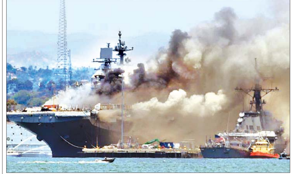
ယူအက်စ်အက်စ်ဘွန်ဟုမ်းရစ်ချက် မီးလောင်နေသည်ကို တွေ့ရစဉ်။

လော့စ်အိန်ဂျလစ် ဇူလိုင် ၁၃ ကယ်လီဖိုးနီးယားပြည်နယ် ဆန်ဒီ ယာဂိုမြို့ရှိ အမေရိကန်ရေတပ် စစ် အခြေစိုက်စခန်းမှ သင်္ဘောပေါ်တွင် ဇူလိုင် ၁၂ ရက်က မီးလောင်မှုကြောင့် သင်္ဘောသား ၁၇ ဦးနှင့် အရပ်သား လေးဦး အပါအဝင် လူပေါင်း ၂၁ ဦး ဒဏ်ရာရရှိခဲ့ကြောင်း အာဏာပိုင်များ က ပြောသည်။ ယူအက်စ်အက်စ် ဘွန်ဟုမ်း ရစ်ချက်ပေါ်တွင် မီးလောင်ခဲ့ခြင်း ဖြစ်ပြီး ဒဏ်ရာရရှိသူများမှာ အသက် အန္တရာယ်မစိုးရိမ်ရဘဲ ဒေသတွင်း ဆေးရုံပေါ်တွင် ဆေးကုသမှုခံယူ လျက်ရှိကြောင်း အမေရိကန် ပစ်ဖိတ် ရေတပ်စုမှ သတင်းထုတ်ပြန်သည်။ သင်္ဘော အမှုထမ်းအားလုံး သင်္ဘောပေါ်မှ ထွက်ခွာခဲ့ကြပြီး လူဦးရေ အရေအတွက်ကို စာရင်းပြုစု ထားကြောင်း အခြားသင်္ဘောများကို လည်း မီးသတ်ရာတွင် အကူအညီပေး ကြရန် ညွှန်ကြားထားကြောင်း သတင်းထုတ်ပြန်ထားသည်။ မီးစတင် လောင်စဉ်က သင်္ဘောပေါ်တွင် သင်္ဘောသား ၁၆၀ ဝန်းကျင်ရှိပြီး ဇူလိုင် ၁၂ ရက် နံနက် ၈ နာရီ ခွဲခန့်တွင် မီးစတင်လောင် ခဲ့ခြင်း ဖြစ်သည်။ အဆိုပါ မီးလောင်မှုကို အဆင့်သုံး အဖြစ်သတ်မှတ်ထားပြီး ဒေသတွင်း နှင့် စစ်အခြေစိုက်စခန်းမှ သင်္ဘောများ ကို အသုံးပြုကာ မီးသတ်သမားများက မီးငြိမ်းသတ်နိုင်ရေး ကြိုးပမ်းခဲ့ကြ သည်။ ယူအက်စ်အက်စ် ဘွန်ဟုမ်း ရစ်ချက် သင်္ဘောသည် ပြုပြင် ထိန်းသိမ်းရေး လုပ်ငန်းများ လုပ်ဆောင်နေချိန်ဖြစ်ပြီး သင်္ဘော သား ၁၀၀၀ ကို တင်ဆောင်နိုင်သည့် ပမာဏရှိကြောင်း အမေရိကန် ရေတပ် ကပြောသည်။ မီးငြိမ်းသတ်နိုင်ရေး ရေတပ် နှင့်အတူ စုစုပေါင်းစည်းဖြင့် ကူညီပေး ခဲ့သည်ဟု ဆန်ဒီယာဂို မီးသတ် ကယ်ဆယ်ရေးဌာနက ပြောသည်။ မီးလောင်ရသည့်အကြောင်းကို မသိရသေးပေ။ မီးလောင်မှုကြောင့်ကို မြင်တွေ့လိုက်ရသူ အချို့က မူ ပေါက်ကွဲသံကြားမိကြောင်း ဒေသ တွင်း သတင်းဌာနများသို့ ပြောကြားခဲ့ ကြသည်။ ဆင်ဟွာ