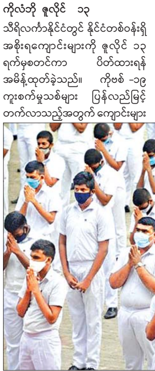
ဇူလိုင် ၆ ရက်က ကိုလံဘိုမြို့ရှိ ကျောင်းတွင် နှာခေါင်းစည်းတပ်ဆင်ထားသည့် ကျောင်းသားများကို တွေ့ရစဉ်။

ကိုလံဘို ဇူလိုင် ၁၃ သီရိလင်္ကာနိုင်ငံတွင် နိုင်ငံတစ်ဝန်းရှိ အစိုးရကျောင်းများကို ဇူလိုင် ၁၃ ရက်မှစတင်ကာ ပိတ်ထားရန် အမိန့်ထုတ်ခဲ့သည်။ ကိုဗစ် - ၁၉ ကူးစက်မှုသစ်များ ပြန့်လည်မြင့်တက်လာသည့်အတွက် ကျောင်းများ ပြန်ဖွင့်ပြီး တစ်ပတ်အကြာတွင် ပြန်ပိတ်ရန် အမိန့်ထုတ်ထားခြင်းဖြစ်သည်။ သီရိလင်္ကာနိုင်ငံတွင် ကိုဗစ် - ၁၉ ကူးစက်ခံရသူ ၂၆၁၇ ဦးရှိပြီး ၁၁၅၅ ဦးသေဆုံးခဲ့ရသည်။ လွန်ခဲ့သည့် တက်လာသည့်အတွက် ကျောင်းများ မူးယစ်ဆေးစွဲသူများ ပြန်လည် ထူထောင်ရေးစခန်း၌ နေထိုင်သူများနှင့် ဝန်ထမ်းများအပါအဝင် လူပေါင်း ၁၁၀၀ တွင် ထက်ဝက်နီးပါးခန့်မှာ ကိုဗစ် - ၁၉ ကူးစက်ခံထားရသည်ဟု စစ်ဆေးတွေ့ရှိရပြီး ယင်းနေရာသို့ လာရောက်ခဲ့သူအချို့တွင် လည်း ကူးစက်ခံရမှုများဖြစ်ပေါ်လာနိုင်သည်ဟု သီရိလင်္ကာတပ်ဖွဲ့အကြီးအကဲဖြစ်သူ ရှာဗန်ဒရာ ဆေဗာက ပြောသည်။ နိုင်ငံတစ်ဝန်း ကျေးရွာများတွင်လည်း ကူးစက်ခံရသူ ၁၆ ဦး ထပ်မံတွေ့ရှိခဲ့သည်။ ကျန်းမာရေးအာဏာပိုင်များ၏ ညွှန်ကြားချက်များကိုအခြေခံကာ ယခုသီတင်းပတ်အတွင်း ကျောင်းများကို ပိတ်ရန် ဆုံးဖြတ်ချက် ချခဲ့ခြင်းဖြစ်ကြောင်း ပညာရေးဝန်ကြီးဌာနက သတင်းထုတ်ပြန်သည်။ ထို့အပြင် ပုဂ္ဂလိကကျောင်းများကိုလည်း ပိတ်သွားရန် တိုက်တွန်းမှုများလုပ်ဆောင်မည်ဟု ပညာရေးဝန်ကြီးဌာနက ပြောသည်။ လာမည့် သီတင်းပတ်အတွင်း အခြေအနေများကို သုံးသပ်မှုများပြန်လည် ပြုလုပ်မည်ဟုလည်း ဆက်လက်ပြောကြားသည်။ နိုင်ငံရပ်ခြားသို့ ရောက်နေသည့် သီရိလင်္ကာနိုင်ငံသား ၁၂၀၀၀ အား နေရပ်ပြန်ခေါ်မည့် အစီအစဉ်ကိုလည်း ဆိုင်းငံ့ထားရသည်။ အေအက်မီစီ