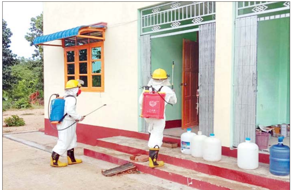
ဇူလိုင် ၃ ရက်က မကွေးတိုင်းဒေသကြီး ဂန့်ဂေါခရိုင် ထီးလင်းမြို့နယ် ကျွန်းမာရေးဝန်ထမ်း အိမ်ရာသစ်တွင် ကိုဗစ်-၁၉ ကာကွယ်ဆေးဖျန်းစဉ်။ သတင်းစဉ်

သိရသည်။ အလားတူ ဇူလိုင် ၄ ရက်က နေပြည်တော်၊ တိုင်းဒေသကြီး/ပြည်နယ်များမှ မြို့နယ် ၂၁ မြို့နယ်ရှိ နေရာ ၄၂ နေရာတွင် မီးသတ်ယာဉ်များ၊ မီးသတ်ပစ္စည်းကိရိယာများဖြင့် ဆောင်ရွက်ခဲ့ရာ ပိုးသတ်ဆေးရည် ၃၆ ဂါလန်နှင့် ပိုးသတ်ဆေးမှုန့် ၇ ကီလိုဂရမ်သုံးစွဲခဲ့ပြီး ပိုးသတ်ဆေးဖျန်းခြင်းလုပ်ငန်းများကို တာဝန်ရှိသူများက လိုက်လံကြည့်ရှု အားပေးခဲ့ကြောင်း သိရသည်။