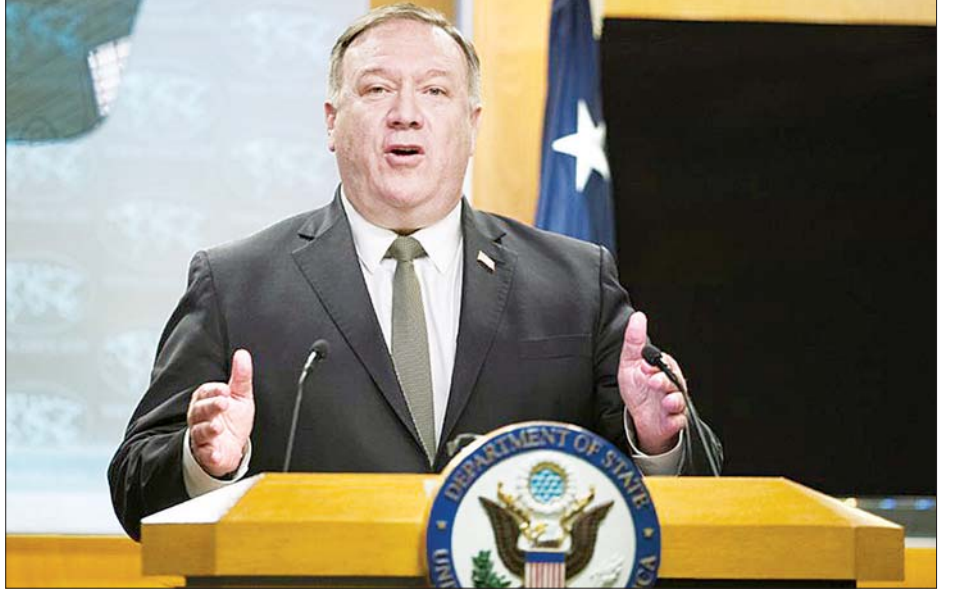
အမေရိကန်နိုင်ငံခြားရေးဝန်ကြီး မိုက်ပွန်ပီဆို

ပုံးဒဏ်မှ လွတ်မြောက်လာသူက နျူကလီးယား တားဆီးရေးစာချုပ်အတွက် ထပ်မံတောင်းဆို