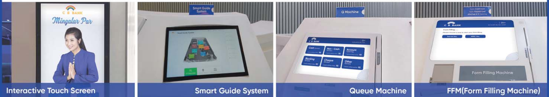
Interactive Touch Screen