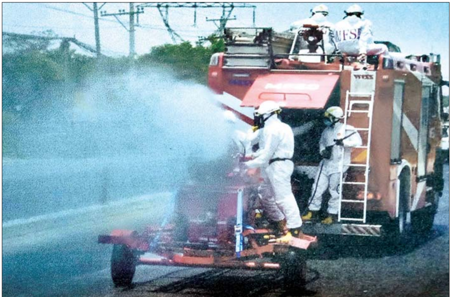
ဇူလိုင် ၃ ရက်က ရန်ကုန်တိုင်းဒေသကြီး ကျောက်တံတားမြို့နယ်အတွင်း ကိုဗစ်-၁၉ ကာကွယ်ဆေးဖျန်းစဉ်။ သတင်းစဉ်