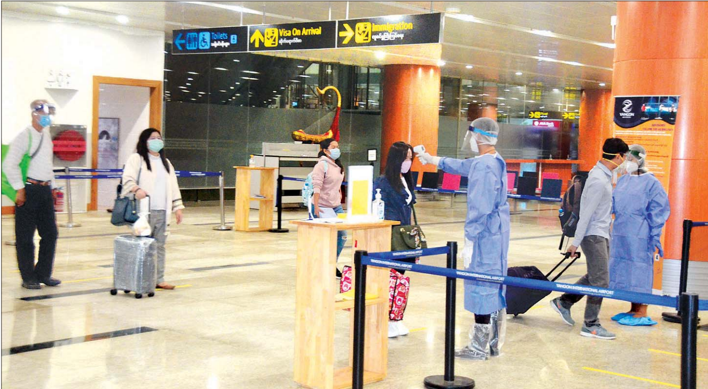
နေပြည်တော် ဇူလိုင် ၈

ပြည်ပနိုင်ငံများတွင် အခက်အခဲကြုံတွေ့နေရသည့် မြန်မာနိုင်ငံသားများအား ပြန်လည်ခေါ်ဆောင်ရန် Coronavirus Disease 2019 (COVID-19) ကာကွယ်၊ ထိန်းချုပ်၊ ကုသရေး အမျိုးသားအဆင့် ဗဟိုကော်မတီ၏ လမ်းညွှန်ချက်နှင့်အညီ နိုင်ငံခြားရေးဝန်ကြီးဌာနအနေဖြင့် သက်ဆိုင်ရာဝန်ကြီးဌာနများ၊ သက်ဆိုင်ရာနိုင်ငံများရှိ မြန်မာသံရုံးများနှင့် ပူးပေါင်းညှိနှိုင်း၍ ဆောင်ရွက်ပေးလျက်ရှိရာ စင်ကာပူနိုင်ငံတွင် ရောက်ရှိနေပြီး မြန်မာနိုင်ငံသို့ပြန်ရန် အခက်အခဲကြုံတွေ့နေရသည့် မြန်မာနိုင်ငံသား ၁၅၅ ဦးတို့အား စင်ကာပူနိုင်ငံ ချန်ဂီအပြည်ပြည်ဆိုင်ရာလေဆိပ်မှ တစ်ဆင့် မြန်မာအမျိုးသားလေကြောင်းလိုင်း (MNA) ကယ်ဆယ်ရေးလေယာဉ်ဖြင့် ပြန်လည်ခေါ်ဆောင်ခဲ့ရာ ယနေ့ ညနေ ၄ နာရီ ၄၅ မိနစ်တွင် ရန်ကုန်အပြည်ပြည်ဆိုင်ရာလေဆိပ်သို့ အဆင်ပြေချောမွေ့စွာ ပြန်လည်ရောက်ရှိခဲ့ကြသည်။