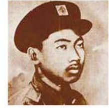
ရဲဘော်ကိုထွေး

တွင်းမှ တရုတ်လူမျိုးယောင်ဆောင်၍ ထွက်ခဲ့လေသည်။ အရှင်မြို့၌ ဂျပန်ကိုယ်စားလှယ်များနှင့် ဆက်သွယ်မိ ရာက ဂျပန်ပြည်တွင် ဗိုလ်ဦးကြီးခေါ် ကာနယ်ဆူဇွဲနှင့် တွေ့ပြီး ဗမာလွတ်လပ်ရေးကို ပူးပေါင်း တိုက်ခိုက်ရန် ပထမ ဆုံးအကြိမ် ဆွေးနွေးခဲ့လေသည်။