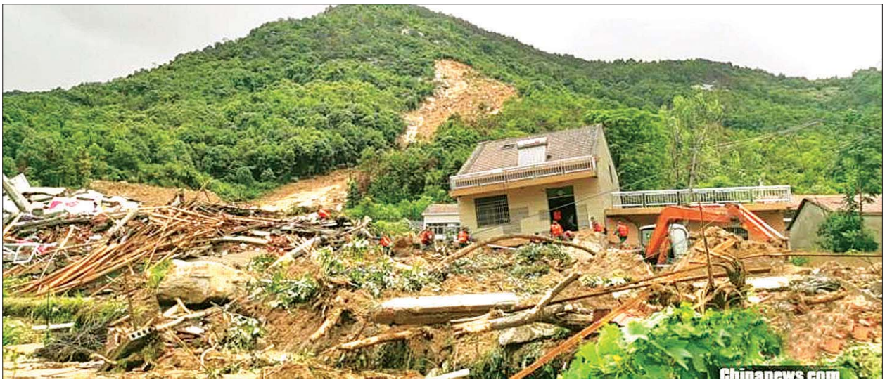
တရုတ်နိုင်ငံရှိ မြေပြိုမှုဖြစ်ပွားခဲ့သည့်နေရာတွင် အဆောက်အအုံများ ထိခိုက်ပျက်စီးမှုကို တွေ့ရစဉ်။

တရုတ်နိုင်ငံရှိ ဇူလိုင် ၈ ရက်တွင် မိုးသည်းထန်စွာရွာသွန်းခဲ့ပြီး မိုးရေချိန် ၂၀၀ မီလီမီတာ ကျော်လွန်ခဲ့သည်။ ဒါဟီရှိ မိုးရွာသွန်းမှုသည် ၃၅၃ မီလီမီတာဖြင့် စံချိန်တင်မိုးရေချိန်အမှတ်တံဆိပ် ရောက်ရှိခဲ့သည်။