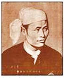
ဗိုလ်ချုပ်အောင်ဆန်း

ဝူစလီကားကြီးပေါ်တွင် တည်ငြိမ်လေးနက်စွာ လိုက်ပါလာသော ဗိုလ်ချုပ်၏စိတ်ထဲတွင် နိုင်ငံတစ်နိုင်ငံ ၏ လွတ်လပ်ရေးကို ပြန်လည်ရယူရန်ကား မလွယ်ကူ လှကြောင်းကို စဉ်းစားကောင်း စဉ်းစားနေပေလိမ့်မည်။ သူသည် ၁၉၄၀ ပြည့်နှစ် ဩဂုတ်လ ၈ ရက် အသက် ၂၆ နှစ်သားအရွယ်လောက်တွင် နယ်ချဲ့ဆန့်ကျင်ရေး တိုက်ပွဲသည် ပြည်ပအင်အားနှင့် ပြည့်စုံသော နိုင်ငံ တစ်ခုခု၏ အကူအညီကိုမရလျှင် မအောင်မြင်နိုင် ကြောင်းကို သဘောပေါက်မိသည့်အတွက် မြန်မာနိုင်ငံ