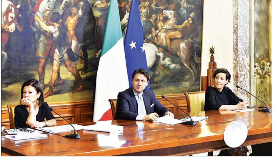
ဇူလိုင် ၇ ရက်က အီတလီနိုင်ငံ ရောမမြို့တွင် အစည်းအဝေးတက်ရောက်နေသော အီတလီဝန်ကြီးချုပ် ဂူဆက်ပီကွန်တီ (လယ်) ကို တွေ့ရစဉ်။

ဘရပ်ဆဲလ်တွင် ကျင်းပမည့် အီးယူကောင်စီအစည်းအဝေး၌ အီးယူခေါင်းဆောင်များသည် ကိုဗစ်-၁၉ အကျပ်အတည်းကို တုံ့ပြန်မည့် ပြန်လည်ထူထောင်ရေးအစီအစဉ်ကို ဆွေးနွေးသွားမည်ဖြစ်သလို အီးယူ၏ ဘတ်ဂျက်ကိုလည်း ဆွေးနွေးသွားမည်ဖြစ်သည်။ ယခုအသွင်ပြောင်းရေးအစီအစဉ်သည် အီတလီနိုင်ငံ အတွက် တိုးတက်မှုများကို ဖော်ဆောင်မည့် လုပ်ငန်းတစ်ရပ် ဖြစ်သည်။ ဆင်ဟွာ