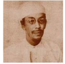
ဒီးဒုတ်ဦးဘချို