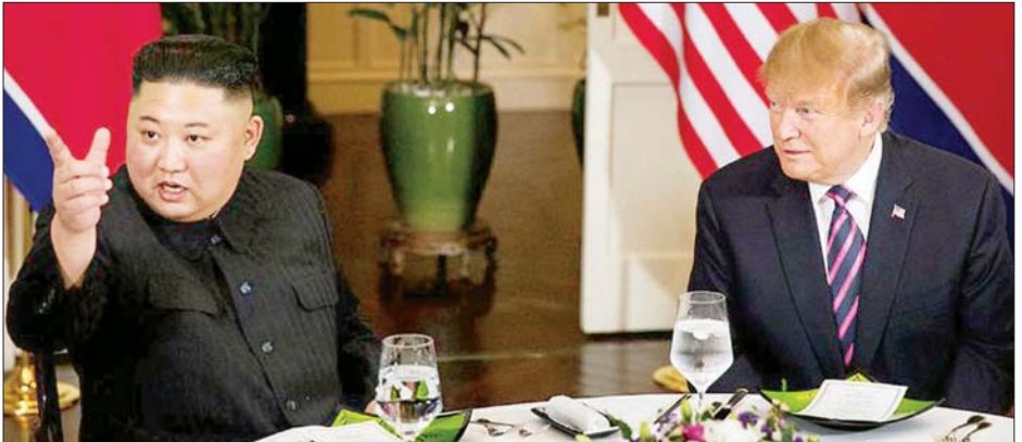
ပြီးခဲ့သည့်နှစ်က သုံးကြိမ်တိုင်တိုင် တွေ့ဆုံခဲ့ကြသည့် မြောက်ကိုရီးယားခေါင်းဆောင်ကင်နှင့် အမေရိကန်သမ္မတ ဒေါ်နယ်ထရမ်