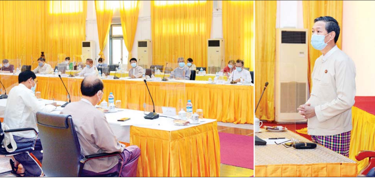
ပြည်ထောင်စုဝန်ကြီး ဒေါက်တာမျိုးသိမ်းကြီး အခြေခံပညာသင်ရိုး ညှိနှိုင်းအစည်းအဝေးတွင် အမှာစကားပြောကြားစဉ်။ သတင်းစဉ်

ရှေးဦးစွာ ပညာရေးဝန်ကြီးဌာန ပြည်ထောင်စုဝန်ကြီး ဒေါက်တာ မျိုးသိမ်းကြီးက ကျောင်းများ ပြန်လည်ဖွင့်လှစ်မည့် အစီအစဉ်အရ အခြေခံပညာ အထက်တန်းအဆင့် ကျောင်းများအားလုံးကို လာမည့် ဇူလိုင် ၂၁ ရက်တွင် ကျန်းမာရေးနှင့် အားကစားဝန်ကြီးဌာန၏ ညွှန်ကြား ချက်များနှင့်အညီ ကျန်းမာရေးနှင့် ညီညွတ်၍ လုံခြုံဘေးကင်းစေရန် စီစဉ် ဆောင်ရွက်ပြီး ပြန်လည်ဖွင့်လှစ် သွားမည်ဖြစ်ကြောင်း၊ ကျောင်းများ ပြန်လည်ဖွင့်လှစ်ရာတွင် Physical Distancing အရ ဆရာ၊ ကျောင်းသား တစ်ဦးနှင့် တစ်ဦးအကြား ခြောက်ပေ ခြားပြီး သင်ကြားသင်ယူနိုင်ရန် စီစဉ် ထားပါကြောင်း၊ ကျောင်းသား ကျောင်းသူဦးရေ ဆရာ ဆရာမဦးရေ စာသင်ခန်းနှင့် စာသင်ခန်းအရေအတွက် များအပေါ် မူတည်၍ ကျောင်းပြန်ဖွင့် ရာတွင် ပုံမှန်အတိုင်းဖွင့်မည့် ကျောင်း များ၊ တစ်ပတ်ခြားဖွင့်မည့် ကျောင်း