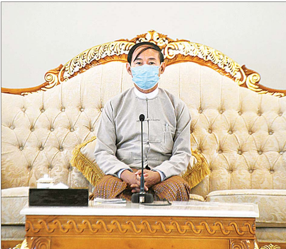
နိုင်ငံတော်သမ္မတ ဦးဝင်းမြင့် ၂၀၂၀ ပြည့်နှစ် ပါတီစုံဒီမိုကရေစီအထွေထွေရွေးကောက်ပွဲကို လွတ်လပ်ပြီး တရားမျှတသော ရွေးကောက်ပွဲဖြစ်စေရေးအတွက် ပြည်ထောင်စုရွေးကောက်ပွဲကော်မရှင်ဥက္ကဋ္ဌ၊ ပြည်ထောင်စုဝန်ကြီးများ၊ ပြည်ထောင်စု ရှေ့နေချုပ်နှင့် ကော်မရှင်အဖွဲ့ဝင်များအား တွေ့ဆုံလမ်းညွှန်ဟုကြားစဉ်။

၂၀၂၀ ပြည့်နှစ် ပါတီစုံ ဒီမိုကရေစီအထွေထွေရွေးကောက်ပွဲကို လွတ်လပ်ပြီး တရားမျှတသောရွေးကောက်ပွဲဖြစ်စေရေးအတွက် ပြည်ထောင်စုရွေးကောက်ပွဲကော်မရှင်ဥက္ကဋ္ဌ၊ ပြည်ထောင်စုဝန်ကြီးများ၊ ပြည်ထောင်စုရှေ့နေချုပ်နှင့် ကော်မရှင်အဖွဲ့ဝင်များအား တွေ့ဆုံလမ်းညွှန်ဟုကြား