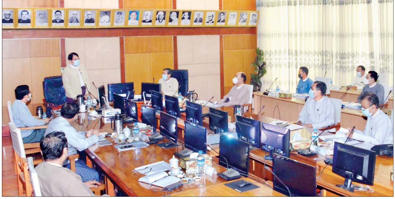
ပြည်ထောင်စုဝန်ကြီး ဒေါက်တာဖေမြင့် ကျောင်းသုံးစာအုပ်များ ရိုက်နှိပ်ဖြန့်ချိရေးကော်မတီအစည်းအဝေးတွင် အမှာစကားပြောကြားစဉ်။ သတင်းစဉ်

၂၀၂၁-၂၀၂၂ ပညာသင်နှစ်အတွက် အခြေခံပညာကျောင်းသုံးစာအုပ်များ အရည်အသွေးပြည့်မီစွာ ပုံနှိပ် ထုတ်လုပ်နိုင်ရေးအတွက် ကျောင်းသုံးစာအုပ်များ ရိုက်နှိပ်ဖြန့်ချိရေးကော်မတီအစည်းအဝေးအမှတ်စဉ် (၃/၂၀၂၀) ကို ယနေ့ မွန်းလွဲ ၁ နာရီက နေပြည်တော်ရှိ ပြန်ကြားရေးဝန်ကြီးဌာန အစည်းအဝေးခန်းမ၌ ကျင်းပသည်။