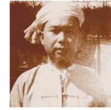
စဝစ်ထွန်း