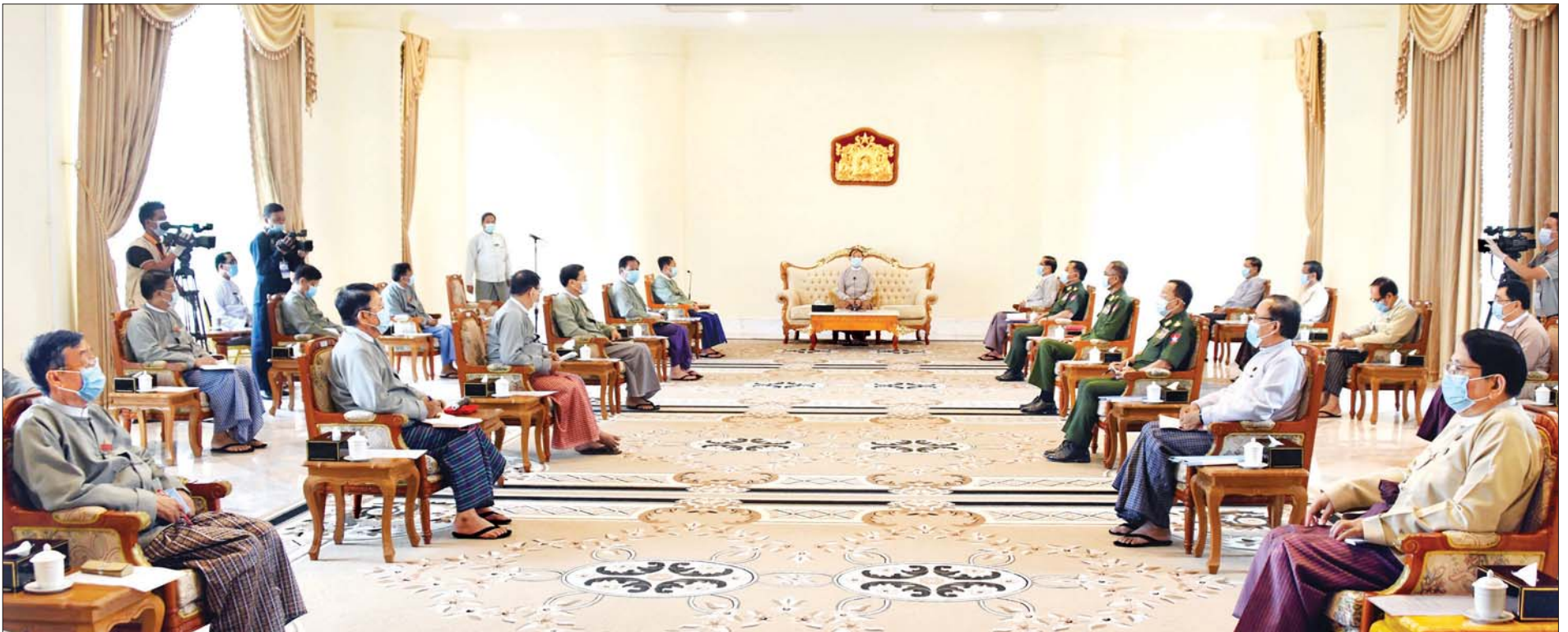
နိုင်ငံတော်သမ္မတ ဦးဝင်းမြင့် ၂၀၂၀ ပြည့်နှစ် ပါတီစုံဒီမိုကရေစီအထွေထွေရွေးကောက်ပွဲကို လွတ်လပ်ပြီး တရားမျှတသော ရွေးကောက်ပွဲဖြစ်စေရေးအတွက် ပြည်ထောင်စုရွေးကောက်ပွဲကော်မရှင်ဥက္ကဋ္ဌ၊ ပြည်ထောင်စုဝန်ကြီးများ၊ ပြည်ထောင်စုရှေ့နေချုပ်နှင့် ကော်မရှင် အဖွဲ့ဝင်များအား တွေ့ဆုံလမ်းညွှန်မှာကြားစဉ်။ သတင်းစဉ်