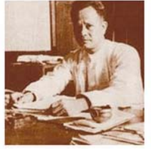
မန်းဘခိုင်