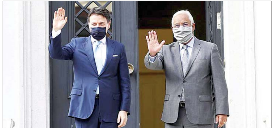
ပေါ်တူဂီဝန်ကြီးချုပ်အန်တိုနီယို ကိုဗ်တာ (ယာ)က အီတလီဝန်ကြီးချုပ် ဂူဆက်ပီကွန်တီကို ပေါ်တူဂီနိုင်ငံ လစ္စဘွန်းမြို့တွင် ဇူလိုင် ၇ ရက်က တွေ့ဆုံစဉ်။