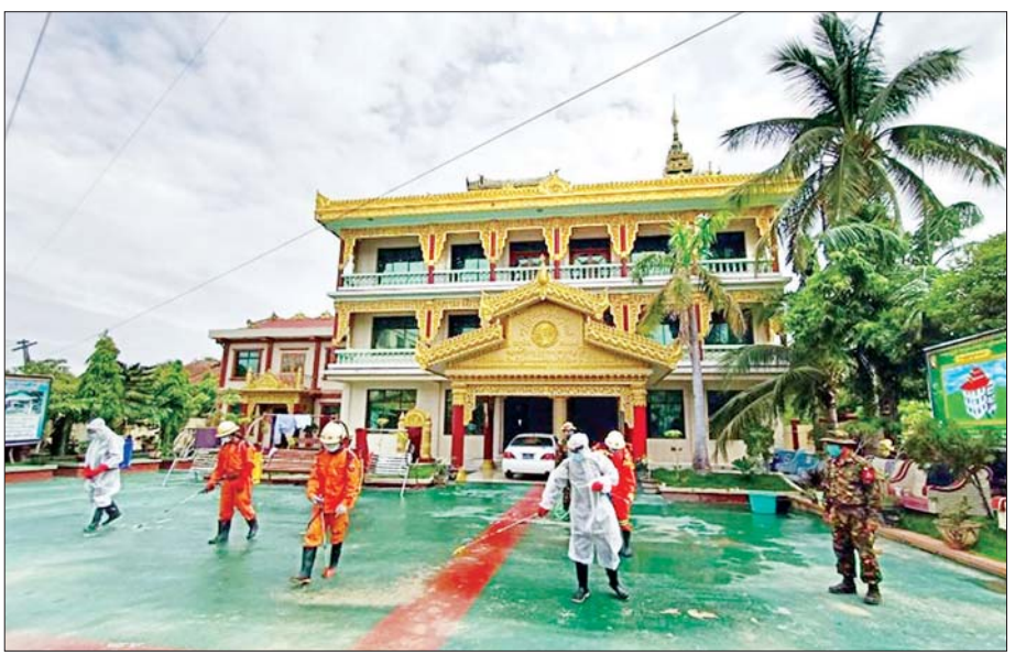
ဇူလိုင် ၄ ရက်က မန္တလေးတိုင်းဒေသကြီး ပြည်ကြီးတံခွန်မြို့နယ် တံခွန်တိုင်ရပ်ကွက် ငြိမ်းချမ်းရွှေပြည်ကျောင်း တိုက်အား ကိုဗစ်-၁၉ ကာကွယ်ဆေးဖျန်းစဉ်။ သတင်းစဉ်