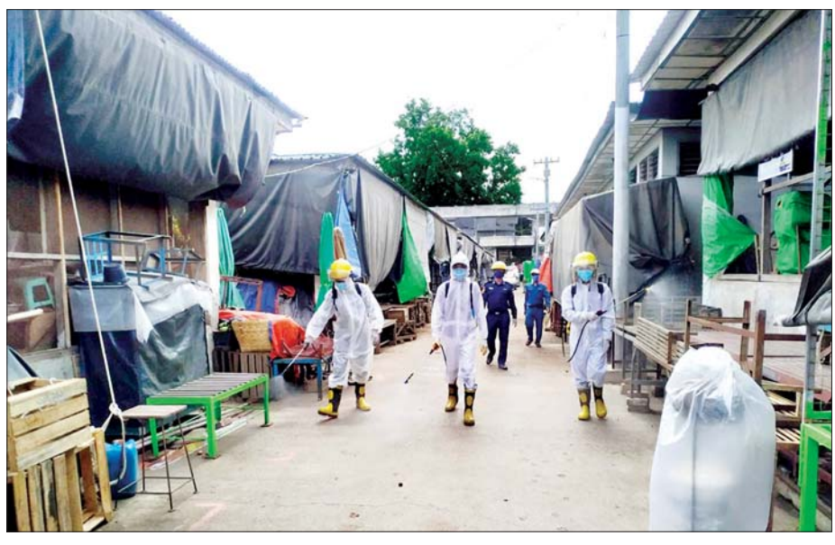
ဇူလိုင် ၄ ရက်က စစ်ကိုင်းတိုင်းဒေသကြီး စစ်ကိုင်းမြို့နယ်ရှိ မြို့မဈေးအား ကိုဗစ်-၁၉ ကာကွယ်ဆေးဖျန်းစဉ်။ သတင်းစဉ်