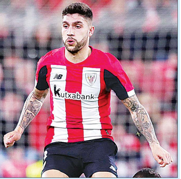
စာမျက်နှာ ၁၁ ကော်လံ ၅ ○

လာသော သတင်းများအရ အဆိုပါ ကစားသမားအတွက် တိကျခိုင်မာသည့် ကမ်းလှမ်းမှုမျိုး မရရှိသေးကြောင်း သိရသည်။ ဘီလ်ဘာအိုအသင်းနှင့် ၎င်း၏ ပွဲဦးထွက်ပွဲကိုတော့ ၂၀၁၇ ခုနှစ် ဩဂုတ်လတွင် ဂီတာဖေးအသင်းနှင့် ဂိုးမရှိ သရေကျခဲ့သည့် ပွဲစဉ်တွင် ပါဝင်ကစားခဲ့သည်။ ၂၀၁၇ ခုနှစ် အောက်တိုဘာလနောက်ပိုင်းတွင် ပုံမှန်ပွဲထွက်ခွင့် ရရှိခဲ့ပြီး စာချုပ်ဖျက်သိမ်းကြေး ယူရိုသန်း ၃၀ နှင့်အတူ ၂၀၂၃ ခုနှစ်အထိ ရှိမည်ဖြစ်သော စာချုပ်သစ်ရပ်ကို ချုပ်ဆိုနိုင်ခဲ့သည်။ ၎င်းသည် ၂၀၁၇-၂၀၁၈ ခုနှစ်တွင် ဘီလ်ဘာအိုအသင်းအတွက် ပြိုင်ပွဲအရပ်ရပ် ၃၆ ပွဲအထိ ပါဝင်ကစားခွင့်ရခဲ့သော်လည်း ယခုနှစ်တွင် ပြိုင်ပွဲစုံ