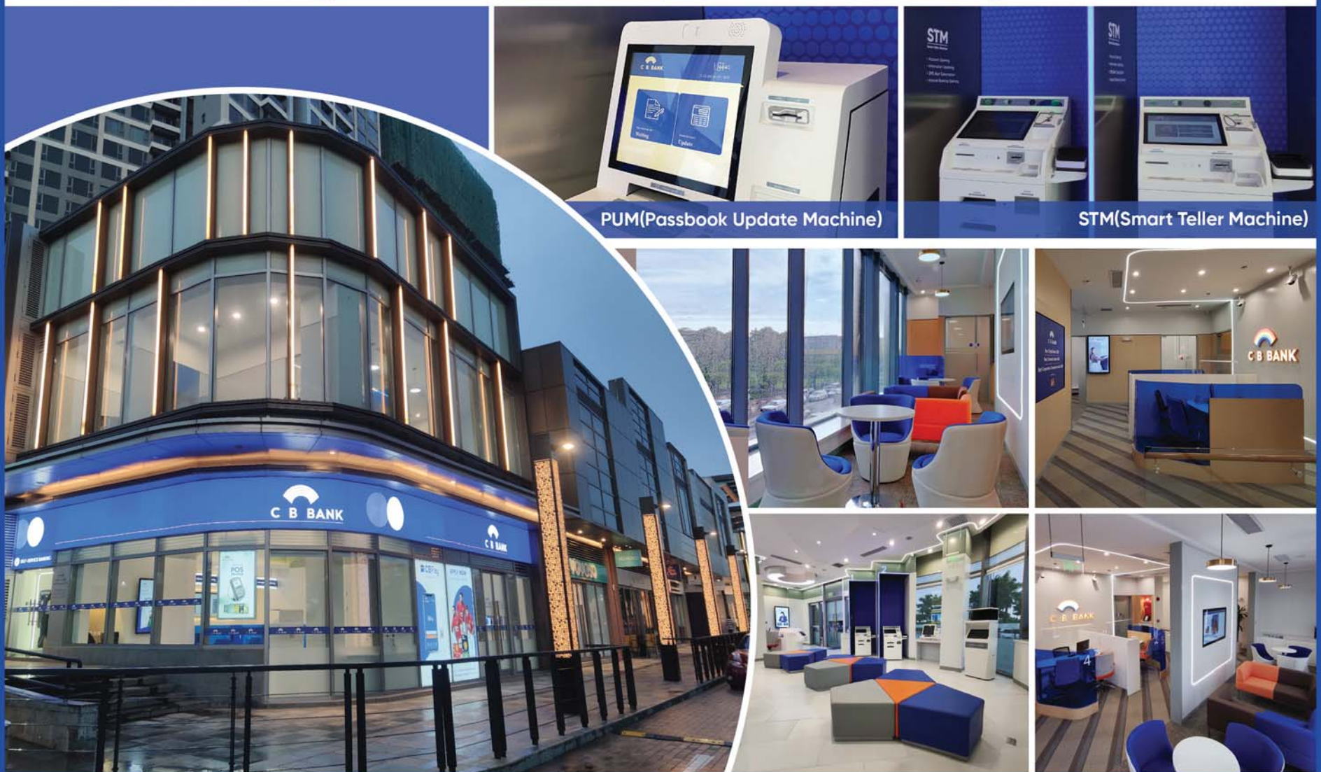
PUM(Passbook Update Machine)