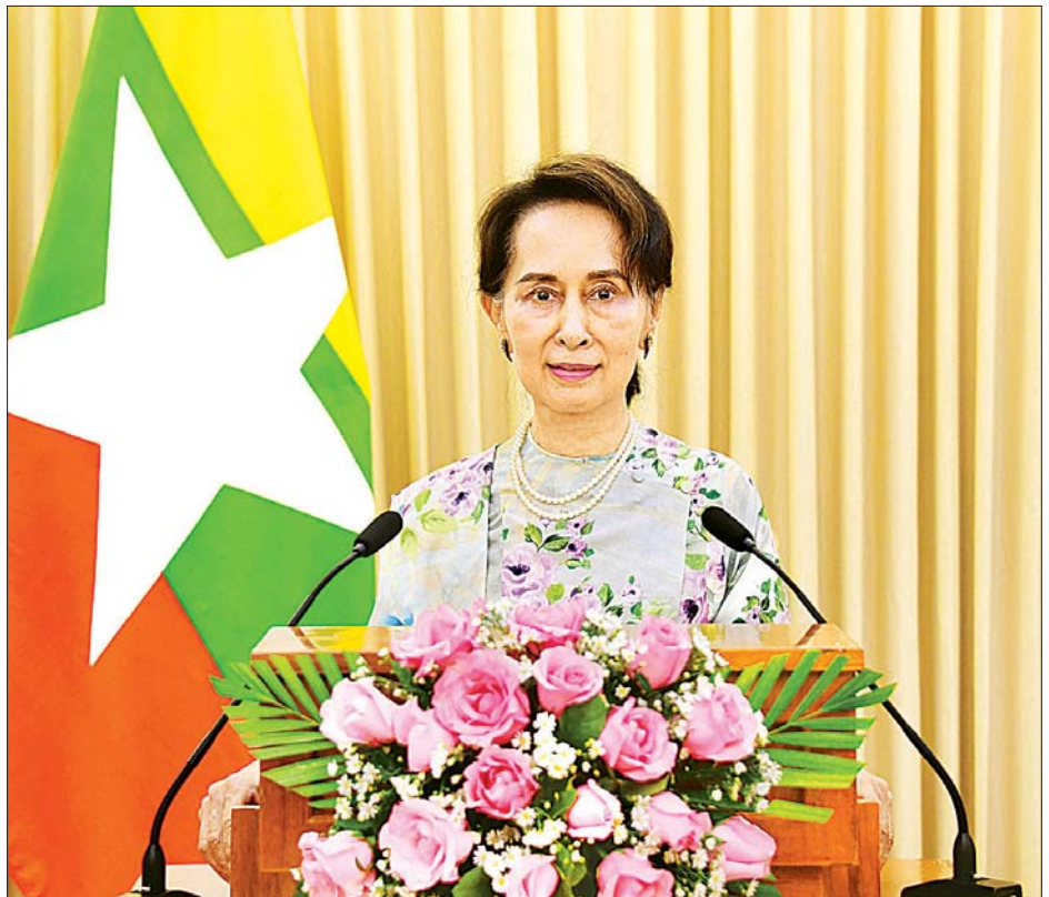
နိုင်ငံတော်၏အတိုင်ပင်ခံပုဂ္ဂိုလ် ဒေါ်အောင်ဆန်းစုကြည် ကိုဗစ်-၁၉ ကူးစက်ရောဂါနှင့် ကမ္ဘာ့အလုပ်အကိုင် ကဏ္ဍဆိုင်ရာ ILO ကမ္ဘာ့ထိပ်သီးအစည်းအဝေး ကာလအတွင်း ကျင်းပသည့် ကမ္ဘာ့ခေါင်းဆောင်များနေ့ အခမ်းအနားတွင် ဗီဒီယိုဖြင့် မိန့်ခွန်းပြောကြားစဉ်။

ကိုဗစ်-၁၉ ကူးစက်ရောဂါနှင့် ကမ္ဘာ့အလုပ်အကိုင် ကဏ္ဍဆိုင်ရာ ILO ကမ္ဘာ့ထိပ်သီးအစည်းအဝေး ကာလအတွင်း ကျင်းပသည့် ကမ္ဘာ့ခေါင်းဆောင်များနေ့ အခမ်းအနားတွင် ဗီဒီယိုဖြင့် မိန့်ခွန်းပြောကြား