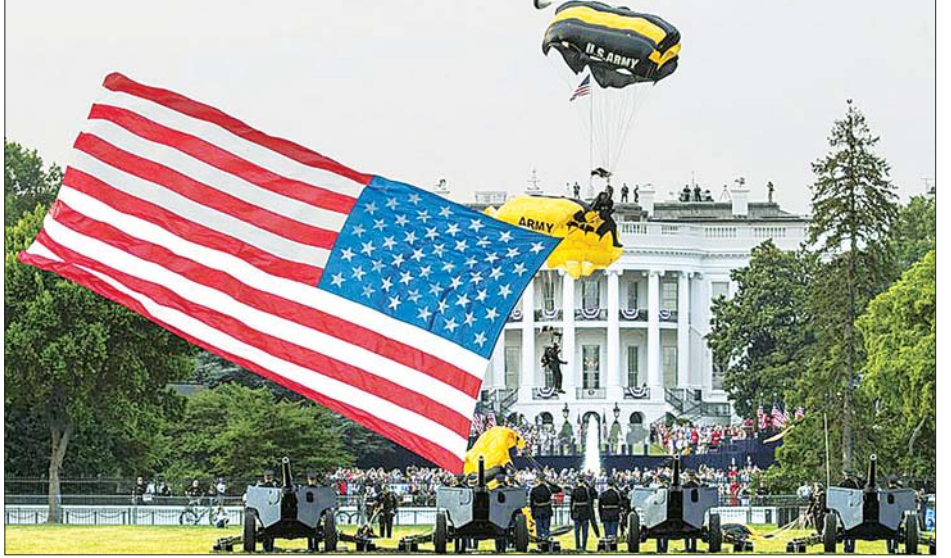
လွတ်လပ်ရေးနေ့အထိမ်းအမှတ်အခမ်းအနား ကျင်းပနေကြစဉ်။

သမ္မတထရမ်နှင့် ထောက်ခံသူများသည် အိမ်ဖြူတော်တောင်ဘက်မြင်ခင်းပြင်မှ စစ်လေယာဉ်များ ဂုဏ်ပြုပျံသန်းမှုကို ကြည့်ရှုခဲ့ကြသည်။ အမေရိကန်တွင် ကိုဗစ်-၁၉ ကူးစက်ခံရမှုမှာ ဆက်လက်မြင့်တက်နေဆဲဖြစ်ပြီး မကြာသေးမီ ရက်ပိုင်းအတွင်း ကူးစက်မှုအသစ် ၅၀၀၀ နီးပါး တွေ့ရှိခဲ့ရသည်။ ကိုဗစ်-၁၉ ကူးစက်မှုပျံ့နှံ့မှုသည် နှိုးရိမ်သောကြောင့် လွတ်လပ်ရေးနေ့အထိမ်းအမှတ် ချီတက်ပွဲကို ဖျက်သိမ်းထားရသည်။ နိုင်ငံတစ်ဝန်းအခြားသော ပွဲလမ်းသဘင်များကိုလည်း ဖျက်သိမ်းထားရသည်။ ဝါရှင်တန်မြို့အပါအဝင် အခြားသောမြို့ကြီးများတွင်လည်း လူမျိုးရေးခွဲခြားမှုကို ဆန့်ကျင်သည့် ဆန္ဒပြမှုများမှာ ဇူလိုင် ၄ ရက်က ဖြစ်ပွားခဲ့သည်။ အင်န်အိတ်ချ်က