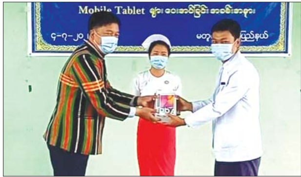
ပြည်နယ်လူမှုရေးဝန်ကြီးက ကျန်းမာရေးဝန်ထမ်းများအား Mobile Tablet များ ပေးအပ်စဉ်။

ကျန်းမာရေးနှင့် အားကစား ဝန်ကြီးဌာနမှ ချင်းပြည်နယ်အတွင်းရှိ မြို့နယ်ကျန်းမာရေးဦးစီးမှူး ကိုးဦး၊ တိုက်နယ်ကျန်းမာရေးဦးစီးမှူး ၂၀နှင့် အခြေခံကျန်းမာရေးဝန်ထမ်း ၉၁၁ဦး အတွက် Mobile Tablet စုစုပေါင်း ၉၄၀ ဖြန့်ဝေပေးပြီး ဖြစ်ကြောင်း သိရ သည်။