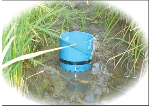
စိုက်ခင်းအတွင်း ရေတိုင်းကိရိယာ ထားရှိပုံ။

အိမ်သုံးရန်အတွက် ရေရရှိနိုင်သလို မိသားစုတစ်ဝိုက်တစ်နိုင် စိုက်ပျိုးထားသော ဟင်းသီးဟင်းရွက် စိုက်ခင်းများအတွက်လည်း အသုံးပြုနိုင်မည်ဖြစ်ပါသည်။ သီးနှံအထွက်တိုးရန်အတွက် စိုက်ခင်းမြေအစိုဓာတ်မလုံလောက်စွာ ရရှိရန် စိုက်ခင်းဘေး၌ အကျယ် တစ်ပေ အနက် ၁ ဒသမ ၅ ပေရှိ မိုးရေခံမြောင်းများ တူးပေးထားခြင်းဖြင့် စိုက်ခင်းအတွင်း အစိုဓာတ်ကို ၁၅-၂၅ ရာခိုင်နှုန်းခန့် ပိုမိုထိန်းထားနိုင်ပြီး သီးနှံအထွက်နှုန်းကိုလည်း တိုးတက်ရရှိစေနိုင်ပါသည်။ စိုက်ခင်းဘေးတွင် မိမိတတ်နိုင်သမျှ မြေအောက်ရေကန်များတူး၍ ပလတ်စတစ်များခင်းပြီး မိုးရေကို ထိန်းသိမ်းသိုလှောင်ခြင်းဖြင့် ဝင်ငွေရလွယ်သော ဟင်းသီးဟင်းရွက်စိုက်ခင်းများအတွက် ရေအသုံးပြုနိုင်ပြီး ဝင်ငွေများ ပိုမိုရရှိစေနိုင်ပါသည်။ စိုက်ခင်းအတွင်း မိုးမကျမီ မိုးရေခံမြောင်းများ တူးရန်အတွက် ကုန်ကျစရိတ်မရှိလျှင် မြေအောက်ရေကန်ထပ်ဖြင့် ၁-၃ ပတ်ခန့် စိုက်ခင်း ပတ်ပတ်လည် ထိုးထားခြင်းဖြင့် ရွာချသော မိုးရေကို ဖမ်းယူစုဆောင်းထားနိုင်မည်ဖြစ်ပါသည်။