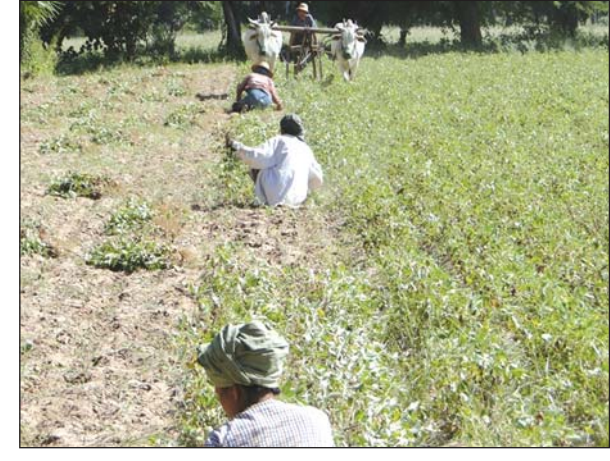
စိုက်ခင်းအတွင်း မြေဖုံးအုပ်ခြင်း (Mulching) ပြုလုပ်နေစဉ်။

ယခုအခါတွင် မြန်မာပြည်အလယ်ပိုင်း အပူပိုင်းဇုန် ဒေသစိုက် မြေပဲ၊ နှမ်း၊ နေကြာ သီးနှံများနှင့် ပဲမျိုးစုံ သီးနှံများအတွက် စိုက်ပျိုးရေးချွေတာနိုင်ရန် ထယ်ကြောင်း ထွန်ကြောင်းများအတိုင်း ရေသွင်းရမည့်အစား မွားစနစ်ဖြင့် ရေသွင်းခြင်း (Sprinkler irrigation) နှင့် အစက်ချရေသွင်းခြင်း (Drip irrigation) စနစ်များကို အသုံးပြု၍ စိုက်ပျိုးနိုင်ပါသည်။ ဤရေသွင်းစနစ်များဖြင့် အပူပိုင်းဇုန် ဒေသစိုက် ယာသီးနှံများတွင် သာမက မိသားစု တစ်နိုင်တစ်ပိုင် စိုက်ပျိုးနိုင်သော ဟင်းသီးဟင်းရွက် သီးနှံစိုက်ခင်းများတွင်ပါ သုံးစွဲခြင်းဖြင့် စိုက်ပျိုးရေးကို ၃၀-၃၅ ရာခိုင်နှုန်းခန့် ချွေတာနိုင်ပြီး ဝင်ငွေများစွာ ပိုမိုရရှိနိုင်ပါသည်။