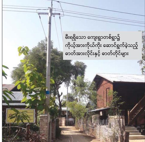
မီးရရှိသော ကျေးရွာတစ်ရွာ၌ ကိုယ့်အားကိုယ်ကိုး ဆောင်ရွက်ခဲ့သည့် ဓာတ်အားလိုင်းနှင့် ဓာတ်တိုင်များ

ရမည်းသင်း ဇူလိုင် ၅ မန္တလေးတိုင်းဒေသကြီးအစိုးရအဖွဲ့၏ ၂၀၁၈-၂၀၁၉ ဘဏ္ဍာရေးနှစ် ရန်ပုံငွေဖြင့် ရမည်းသင်းခရိုင် ပျော်ဘွယ်မြို့နယ်အတွင်းမှ ကျေးရွာမီးလင်းရေးလုပ်ငန်းများ ဆောင်ရွက်ခဲ့သည့် ကျေးရွာငါးရွာတွင် မီးလင်းရေးလုပ်ငန်းများ ပြီးစီးပြီဖြစ် သည့်အတွက် ဇူလိုင် ၃ ရက်မှစ၍ လျှပ်စစ်မီးရရှိပြီဖြစ်ကြောင်း သိရသည်။ မီးရရှိသောကျေးရွာများမှာ ထရီကာကျေးရွာ၊ မောင်းကုန်းကျေးရွာ၊ နန်ချွန် ကျေးရွာ၊ ပန်းတောကျေးရွာနှင့် ပိုကျေးရွာတို့ဖြစ်ပြီး လျှပ်စစ်မီးလင်းရေးအတွက် ကျေးရွာများအတွင်း ၄၀၀ ဝီ ဓာတ်အားလိုင်းများကို ကိုယ့်အားကိုယ်ကိုး ဆောင်ရွက်ခဲ့ကြကြောင်း၊ အဆိုပါ ဓာတ်အားလိုင်းများကို ပျော်ဘွယ်မြို့နယ် လျှပ်စစ်မန်နေဂျာမှ မြို့နယ်လျှပ်စစ်မန်နေဂျာနှင့် လိုင်းဝန်ထမ်းများက လိုက်လံစစ်ဆေးပြီးနောက် ခရိုင်လျှပ်စစ်မန်နေဂျာ ဦးအေးမင်းဝင်း ဦးဆောင်၍ လျှပ်စစ်ဓာတ်အား စတင်လွှတ်ပေးခဲ့ကြောင်း၊ ပျော်ဘွယ်မြို့နယ်တွင် ကျေးရွာ ၂၃၂ ရွာ ရှိသည့်အနက် ယခုမီးရရှိသော ငါးရွာ အပါအဝင် ကျေးရွာ ၁၂၆ ရွာ၌ မီးလင်းပြီဖြစ်ကြောင်း သိရသည်။ တင်ဦး(ရမည်းသင်း)