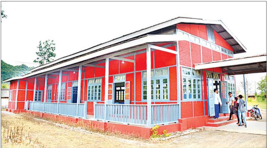
ရွှေပြည်အေး မူးယစ်ဆေးဖြတ်ပြီးသူများ ပြန်လည်ထူထောင်ရေးစခန်း။

ကျွန်တော်တို့မှာ ကန့်သတ်ထားတာကတော့ မိဘ အုပ်ထိန်းသူရဲ့ ခွင့်ပြုချက်တွေ၊ ခံဝန်ကတိတွေကို မိဘ အုပ်ထိန်းသူကော၊ သင်တန်းသားရော လက်မှတ်ထိုး ပေးရမယ်။ ထွက်ပြေးရင်တော့ တာဝန်မယူပါဘူး” ဟု ပြောသည်။ သင်တန်းသားလက်ခံရာတွင် ဒေသရွေး လာရောက် အပ်နှံနိုင်ပြီး သင်တန်းတစ်သုတ်လျှင် သင်တန်းသား ၂၀ သာ လက်ခံမည်ဖြစ်ကြောင်း၊ လူဦးရေ ၂၀ မပြည့်မချင်း လာရောက်အပ်နှံသူရှိပါက ရက်ကန့်သတ်ချက်မရှိဘဲ လက်ခံသွားမည်ဖြစ်ကြောင်း၊ ဆေးဖြတ်ပြီးသူများက နောက်ဆက်တွဲ စောင့်ရှောက်သည့် စေတနာ့ဝန်ထမ်း ကြီးကြပ်ရေး သင်တန်းများဖွင့်ပေးရန်ရှိကြောင်း၊ သင်တန်း သားများအနေဖြင့် သင်တန်းတက်ရောက်ရာတွင် တစ်ကိုယ်ရေသုံးပစ္စည်းများသာ ယူဆောင်လာရမည်ဖြစ် ပြီး ကျန်းမာရေးစောင့်ရှောက်မှုကို စခန်းမှ ဆောင်ရွက် ပေးမည်ဖြစ်ကြောင်း၊ သင်တန်းကာလတွင် စိုက်ပျိုးရေး သင်တန်း၊ ဆိုင်ကယ်ပြင်သင်တန်း၊ ကားဝပ်ရှော့သင်တန်း များကို သင်ကြားပေးမည်ဖြစ်ကာ သင်တန်းဆင်းပါက လည်း မိဘအုပ်ထိန်းသူထံ သေချာပြန်လည်အပ်နှံသွား မည်ဖြစ်ကြောင်း ၎င်းကဆက်လက်ပြောသည်။ ရွှေပြည်အေး မူးယစ်ဆေးဖြတ်ပြီးသူများ ပြန်လည် ထူထောင်ရေးစခန်းကို ၂၀၁၉ ဖေဖော်ဝါရီ ၆ ရက်တွင် ပြည်ထဲရေးဝန်ကြီးဌာနလက်အောက်မှ လူမှုဝန်ထမ်း၊ ကယ်ဆယ်ရေးနှင့် ပြန်လည်နေရာချထားရေးဝန်ကြီး ဌာနသို့လွှဲပြောင်းခဲ့ခြင်းဖြစ်ပြီး ၁၉၈၃ ခုနှစ်မှ ၂၀၀၅ ခုနှစ် အထိ သင်တန်းအပတ်စဉ် ၂၈ ထိ ဖွင့်လှစ်၍ မူးယစ် ဆေးစွဲလူနာ ၄၂၇ ဦး ဆေးဖြတ်ကူးသပေးနိုင်ခဲ့ကြောင်း သိရသည်။ ကိုစိုင်း (လျှိုင်ကော်)