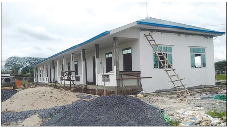
ဆောက်လုပ်မှုများ ပြီးစီးလုနီးပါးဖြစ်နေသော ကျောင်းဆောင်အဆောက်အအုံ