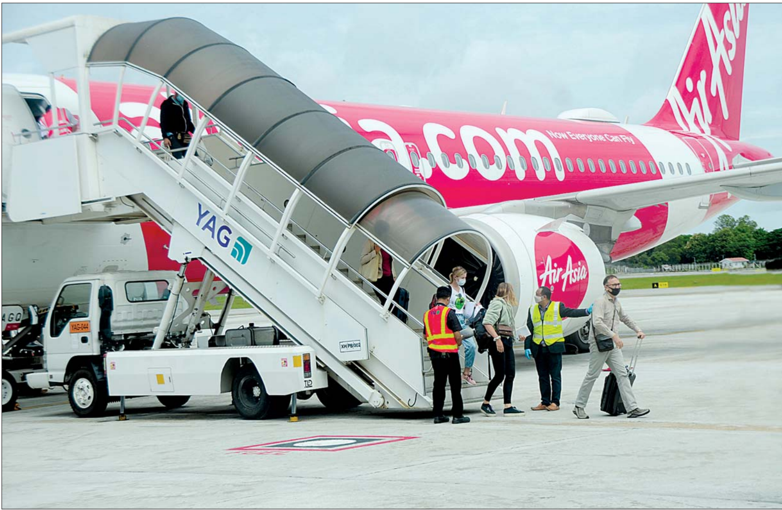
ကမ္ဘာ့စားနပ်ရိက္ခာအစီအစဉ် (WFP) ၏ မြန်မာနိုင်ငံ၌ ကိုဗစ်-၁၉ ရောဂါ ကာကွယ်၊ ထိန်းချုပ်ရေးလုပ်ငန်းများ ဆောင်ရွက်ရာတွင် အသုံးပြုမည့် အထောက်အကူပြုပစ္စည်းများနှင့် လူသားချင်း စာနာထောက်ထားမှု ဖွံ့ဖြိုးရေးဆိုင်ရာ ကူညီဆောင်ရွက်ပေးမည့် ကျွမ်းကျင်ဝန်ထမ်းများတင်ဆောင်လာသော အထူးလေယာဉ် ရန်ကုန်အပြည်ပြည်ဆိုင်ရာလေဆိပ်သို့ ရောက်ရှိလာစဉ်။