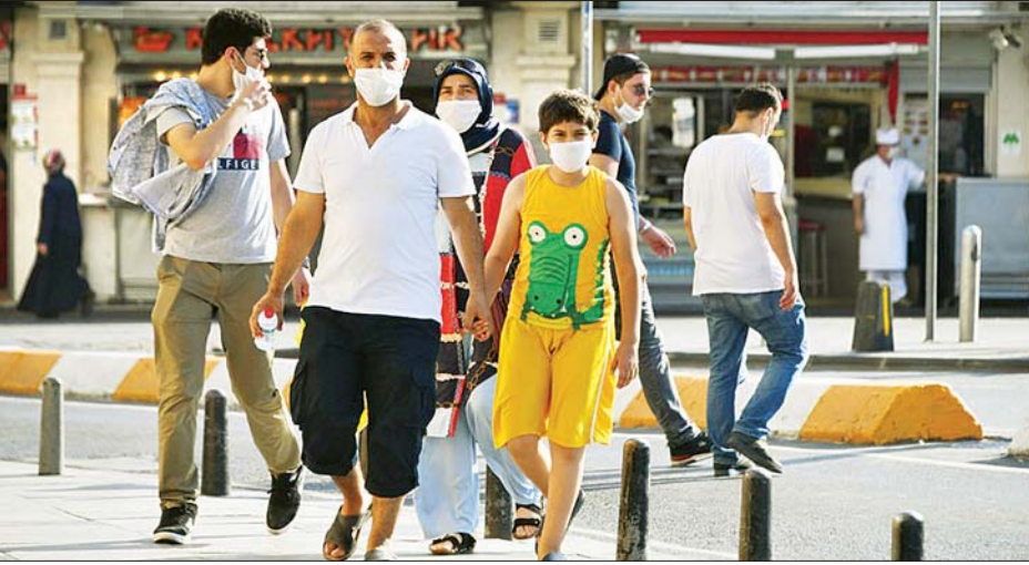
တူရကီနိုင်ငံ အစွတန်ဘူလ်မြို့တွင် နှာခေါင်းစည်းတပ်ဆင်ကာ သွားလာကြသူများကို တွေ့ရစဉ်။