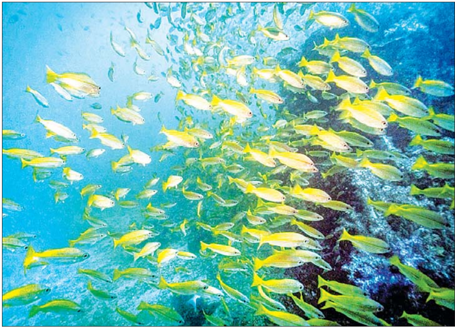
ရခိုင်ကမ်းရိုးတန်းဒေသ သန္တာကျောက်တန်းပတ်ဝန်းကျင်တွင် တွေ့ရသောငါးလေးအုပ်စု။