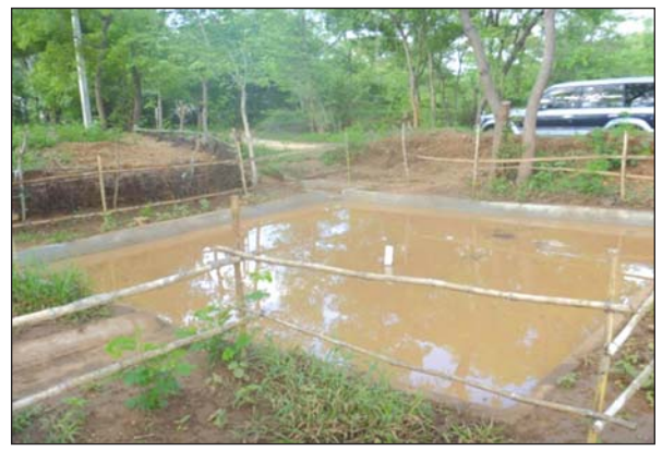
စိုက်ခင်းအနီးတွင် ရေကန်တူး၍ မိုးရေသိုလှောင်ထားပုံ။

သို့ဖြစ်သောကြောင့် ယာသီးနှံများအတွက် အစိုဓာတ်ထိန်းသိမ်းမှုများ ဖြစ်သော မြေဖုံးအုပ်ခြင်း (Mulching) ကို လုပ်ဆောင်ရန် လိုအပ်လာသဖြင့် ပလတ်စတစ်သုံးစွဲခြင်း၊ သီးနှံအကြွင်းအကျန်များကို မီးရှို့ခြင်းမပြုလုပ်ဘဲ စိုက်ခင်းတွင် ဖုံးအုပ်ခြင်းဖြစ်စေ၊ ကောက်ရိုးများဖြင့် ဖုံးအုပ်ခြင်းဖြစ်စေ ပြုလုပ်ရမည်ဖြစ်ပါသည်။