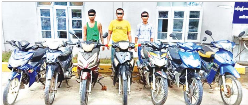
ဝဲမှယာ ပြစ်မှုကျူးလွန်သူ ချစ်ကို၊ ကောင်းဆက်ဝေ(ခ) ဝတုတ်၊ ဝင်းဌေးနှင့် သက်သေခံပစ္စည်းများကို တွေ့ရစဉ်။