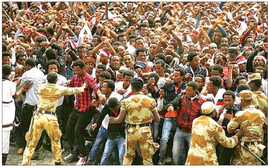
အိသီယိုပီးယားတွင် လုံခြုံရေးတပ်ဖွဲ့ဝင်များနှင့် ဆန္ဒပြသူများ ပဋိပက္ခဖြစ်နေကြစဉ်။