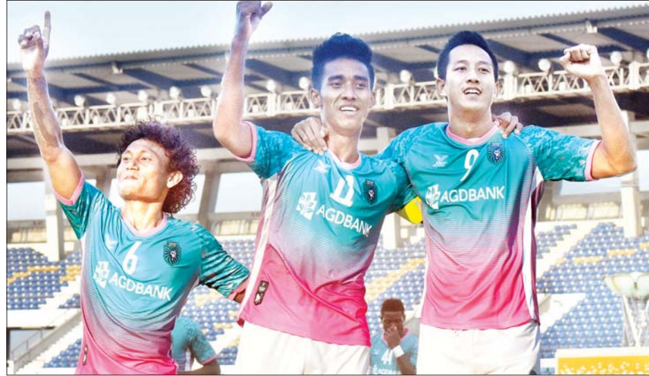
ပထမအကျော့သုံးပွဲကစားပြီးတွင် ခုနစ်မှတ်ရထားသည့် ရန်ကုန်အသင်း။

သတင်း-ညိုမြတ်သော်တာ