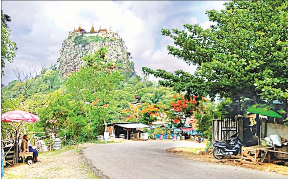
ဖြင့် ဧပြီ ၁ ရက်မှ စတင်၍ ဘုရားဖူးတက်ရောက်ခွင့် ကို ပြန်လည်ခွင့်ပြုခဲ့ကြောင်း သိရပြီး ကျန်းမာရေးနှင့် အားကစားဝန်ကြီးဌာန၏ လမ်းညွှန်ချက်များနှင့်အညီ ဘုရားဖူးတက်ရောက်ခွင့်နှင့် ဈေးရောင်းချခွင့်တို့ကို ဆောင်ရွက်စေခဲ့ကြောင်း သိရသည်။ “ကျွန်တော်တို့ ဘုရားဖူးပြည်သူတွေ ကျန်းမာရေးနဲ့

ကျောက်ပန်းတောင်း ဇူလိုင် ၅ မန္တလေးတိုင်းဒေသကြီး ကျောက်ပန်းတောင်းမြို့နယ် ပုပ္ပါးတောင်ကလပ်တွင် မြို့နယ်ကိုဗစ်-၁၉ ထိန်းချုပ်ရေးနှင့် အရေးပေါ်တုံ့ပြန်ရေးကော်မတီနှင့် လွှတ်တော်ကိုယ်စား လှယ်များ ညှိနှိုင်းခွင့်ပြုချက်ဖြင့် ဘုရားဖူးများ တက်ရောက် ဖူးမြော်ခွင့်ကို ဇူလိုင် ၁ ရက်မှ စတင်ခွင့်ပြုခဲ့သဖြင့် ယခုအခါ တောင်ကလပ်တစ်ခုလုံး ဘုရားဖူးဧည့်သည်များ၊ ဒေသခံ ဈေးသည်များဖြင့် ပြန်လည်သက်ဝင် လှုပ်ရှားစပြုလာပြီ ဖြစ်သည်။ ကိုဗစ်-၁၉ ကူးစက်ရောဂါကြောင့် ခရီးသွားလာခွင့်များ ကန့်သတ်ထားခဲ့ရာ ပုပ္ပါးတောင်ကလပ်ကို ၂၀၂၀ ပြည့်နှစ် ဧပြီလဆန်းမှစ၍ ဘုရားဖူးဧည့်သည်များ လာရောက်မှု မရှိကြတော့သဖြင့် ဒေသခံဈေးသည်များလည်း ဈေးရောင်း ချနိုင်ခြင်း မရှိတော့ဘဲ အလုပ်အကိုင်များ ရပ်နားထားခဲ့ ရကြောင်းသိရသည်။ ယခုအခါ နိုင်ငံတော်အစိုးရနှင့် ကျန်းမာရေးနှင့် အားကစားဝန်ကြီးဌာန၏ ကန့်သတ်မှု များ ဖြေလျှော့ပေးမှုကြောင့် ခရီးသွားလာခွင့်ရရှိလာခဲ့ပြီ ဖြစ်သဖြင့် ကျောက်ပန်းတောင်းမြို့နယ် လွှတ်တော် ကိုယ်စားလှယ်များနှင့် မြို့နယ် ကိုဗစ်-၁၉ ထိန်းချုပ်ရေး နှင့် အရေးပေါ်တုံ့ပြန်ရေးကော်မတီတို့၏ ညှိနှိုင်းခွင့်ပြုချက်