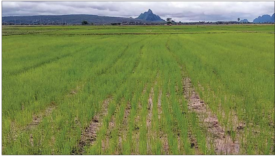
ကရင်ပြည်နယ်ရှိ မိုးစပါးစိုက်ခင်းအချို့ကို တွေ့ရစဉ်။

ကရင်ပြည်နယ်တွင် မိုးကောင်း သောက်လယ် (ရေတော်မိုးတော်)နှင့် ရေကျနောက်စိုက်ဟူ၍ နှစ်မျိုးရှိပြီး လယ်မြေအများစုမှာ အချဉ်ဓာတ် များပြီး မြေဆီပြင်ဆောင်ရွက်ရကာ တစ်ကေ အထွက်နှုန်းတင်း ၇၀ ကျော် ရှိကာ ကရင်ပြည်နယ်အစိုးရအဖွဲ့မှ ဆင်းသုခမျိုးစပါးတင်း ၇၀၀၀ ကို ဝယ်ယူစုဆောင်းထားပြီး ရေတော် မိုးတော်စိုက်ပျိုးကြမည့် တောင်သူများ အား တင်း ၂၀၀၀ ဖြန့်ဖြူးထားပြီး ဖြစ်သည်။ အလားတူ သဘာဝမြေဩဇာ