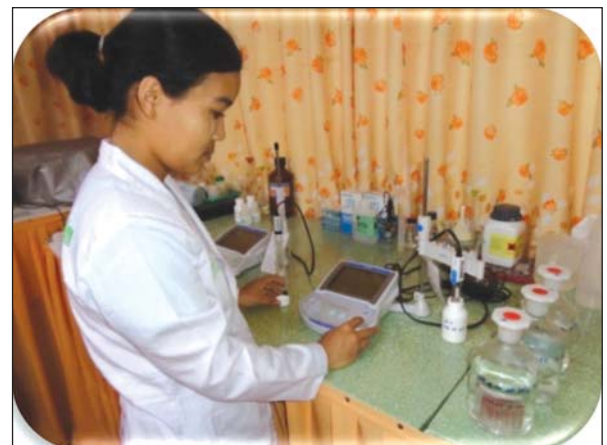
စိုက်ပျိုးရေးသုတေသနဦးစီးဌာန၌ ရေအရည်အသွေး ဓာတ်ခွဲစစ်ဆေးစဉ်။

မိုးရေကို သိုလှောင်ထိန်းသိမ်းခြင်း ယခုအခါတွင် မိုးနည်းခြင်း၊ မိုးခေါင်ခြင်းကြောင့် ရွာသွန်းသောမိုးရေကို ထိန်းသိမ်းသိုလှောင်ရန်လည်းကောင်း၊ အနီးပတ်ဝန်းကျင်မှ စီးဆင်းလာသော မိုးရေများကို ထိန်းသိမ်းသိုလှောင်ရန်လည်းကောင်း လိုအပ်လာပါသည်။ မိမိအိမ်၊ မိမိအဆောက်အအုံ ခေါင်မိုးများမှ မိုးရေကို တိုက်ရိုက်စုဆောင်းခြင်း၊ သီးနှံစိုက်ခင်းများအတွင်း မိုးရေခံမြောင်းများနှင့် ပေါင်များပြုလုပ်၍ စုဆောင်းခြင်းနှင့် စိုက်ခင်းအနီးတွင် ရေကန်များတည်ဆောက်၍ စီးဆင်းလာသော မိုးရေကို စုဆောင်းခြင်းများ ပြုလုပ်ရမည့်အချိန်ဖြစ်ပါသည်။