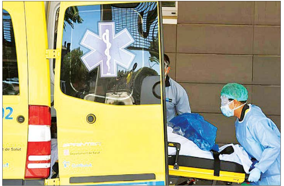
ကက်တလိုနီးယား၌ ကျန်းမာရေးဝန်ထမ်းများက ကိုဗစ်-၁၉ လူနာတစ်ဦးကို ရွှေ့ပြောင်းနေစဉ်။