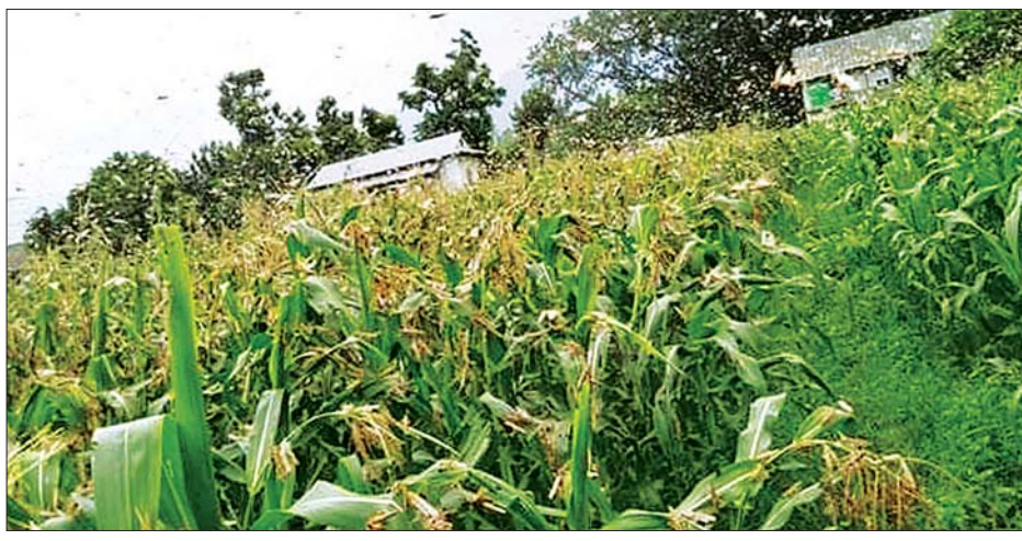
နီပေါနိုင်ငံရှိ စိုက်ခင်းတစ်ခုတွင် ကျိုင်းကောင်းများ ဝင်ရောက်ပျက်စီးမှုကို တွေ့ရစဉ်။