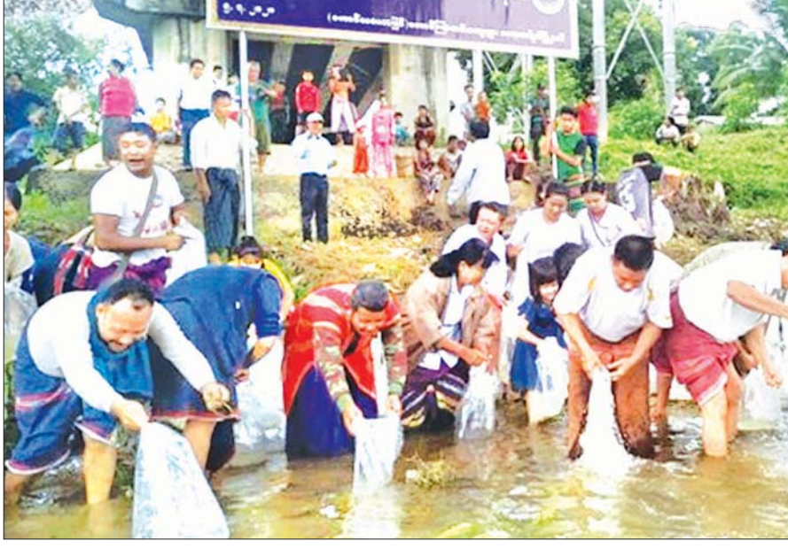
များအတွက် ငါးမြစ်ချင်းသားပေါက် သောင်ရင်းမြစ်၊ ဂျိုင်းမြစ်နှင့် လှိုင်းဘွဲ ငါးဖမ်းဆီးမှု ရှိ/မရှိ ကွင်းဆင်း မြစ်များအတွင်း တားမြစ်ထားသော စစ်ဆေးခဲ့ကြောင်း သိရသည်။

ကော့ကရိတ် ဇူလိုင် ၅ ကရင်ပြည်နယ် ငါးလုပ်ငန်းဦးစီးဌာန ပြည်နယ်ဦးစီးမှူး၊ ဘားအံ/ကော့ ကရိတ်/မြဝတီခရိုင်မှူးနှင့် ဝန်ထမ်း များ ပါဝင်သောအဖွဲ့သည် ဇူလိုင် ၅ ရက်တွင် ကော့ကရိတ်မြို့နယ် တောင်ကြာအင်းကျေးရွာ သောင်ရင်း မြစ်အတွင်းသို့ ငါးမြစ်ချင်းသားပေါက် ကောင်ရေ ၃၀၀၀၊ ငါးမြစ်ချင်း သားပေါက်ကောင်ရေ ၅၀၀၀ စုစု ပေါင်း ငါးကောင်ရေ ၈၀၀၀ ကို လည်းကောင်း၊ တောင်ကြာအင်း ကျေးရွာအနီးရှိ သဘာဝရေပြင် အတွင်းသို့ ငါးမြစ်ချင်းသားပေါက် ကောင်ရေ ၂၀၀၀ ကိုလည်းကောင်း မျိုးစိုက်ထည့်ခဲ့သည်။ (ယာပုံ)