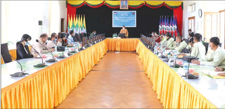
ချေးငွေထုတ်ချေးပေးသည့်ကိစ္စနှင့်ပတ်သက်၍ ပြည်နယ်ဝန်ကြီးချုပ် ဦးဆလှိုင်လျန်လွယ် အမှာစကားပြောကြားစဉ်။

ယခင်က ကျိုက်ထီးရိုးတောရကျောင်း အဝင်လမ်းသည် အကျယ် ၁၀ ပေသာရှိသော မြေသားလမ်းဖြစ်ပြီး ယခုအခါ ၆၀ ပေ အကျယ် မြေသားလမ်း ချဲ့ကာ လိုအပ်သည့် ဂျင်းမြေထည့်၍ အကျယ် ၁၂ ပေတွင် ကွန်ကရစ်ခင်းနေခြင်း ဖြစ်သည်။ လမ်းလုပ်ငန်းအပြင် လျှပ်စစ်မီးပါ သွယ်တန်းပေးနေသည့်အတွက် လုပ်ငန်းများပြီးစီးပါက ဘုရားဖူးပြည်သူများအနေဖြင့် ရာသီမရွေး လွယ်ကူစွာ လာရောက်နိုင်မည်ဖြစ်ကြောင်း သိရသည်။ ဝတ်ရည်(ပြန်/ဆက်)