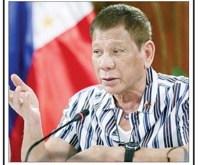
ဖိလစ်ပိုင်သမ္မတ ရိုဒရီဂိုဒူတာတေး

မနီလာ ဇူလိုင် ၄ ဖိလစ်ပိုင်နိုင်ငံသည် အကြမ်းဖက် ဆန့်ကျင်တိုက်ဖျက်ရေး ဥပဒေကို ပြဋ္ဌာန်းလိုက်ကြောင်းနှင့် ၎င်းက လုံခြုံရေးဆိုင်ရာ အာဏာပိုင်များကို အမြင့်ဆုံး လုပ်ပိုင်ခွင့်ပေးလိုက်ခြင်းဖြစ်ကြောင်း နိုင်ငံတကာသတင်း တစ်ရပ်တွင် ဖော်ပြသည်။ ဖိလစ်ပိုင်သမ္မတ ရိုဒရီဂို ဒူတာတေးသည် ဇူလိုင် ၃ ရက်က အကြမ်းဖက်ဆန့်ကျင်တိုက်ဖျက်ရေး ဥပဒေကို လက်မှတ်ရေးထိုးခဲ့သည်။ အဆိုပါဥပဒေက ရဲများနှင့် စစ်ဘက်ဆိုင်ရာများကို အမိန့်စာ မပါဘဲ သံသယရှိသူများကို ၂၄ ရက်အထိ ဖမ်းဆီးထိန်းသိမ်းနိုင်မည်ဖြစ်ကြောင်း သိရသည်။ ထို့အပြင် အဆိုပါဥပဒေသည် သက်ဆိုင်ရာအာဏာပိုင်များက ပြစ်မှု ကျူးလွန်သူများကို ဖမ်းဆီးထိန်းသိမ်းနိုင်ရုံမက မကောင်းမှုကျူးလွန်ရာ တွင် အားပေးကူညီသူများ၊ အကြမ်းဖက်အဖွဲ့အစည်းများအတွက် လူစုဆောင်းသူများကိုပါ ဖမ်းဆီးခွင့်ရှိကြောင်း သိရသည်။ ၂၀၁၇ ခုနှစ်က ဖိလစ်ပိုင်စစ်တပ်က တောင်ပိုင်းကျွန်း မင်ဒါနာအိုတွင် အစွလာမ္မစ် စစ်သွေးကြွများနှင့် ရက်စက်ပြင်းထန်သော တိုက်ပွဲများ ဖြစ်ခဲ့ရာ ပြည်သူ ၁၀၀၀ ထက်မနည်း သေဆုံးခဲ့ရသည်။ ထို့အပြင် ဖိလစ်ပိုင်နိုင်ငံတွင် ဗုံးထောင်ခြင်းနှင့် အခြားအကြမ်းဖက် တိုက်ခိုက်မှုများလည်း ဖြစ်ပွားလာခဲ့သည်။ ဖိလစ်ပိုင်အစိုးရက ယခု ထုတ်ပြန်လိုက်သော ဥပဒေသည် အကြမ်းဖက်ခြိမ်းခြောက်မှု မှန်သမျှကို တားဆီးနိုင်မည်ဖြစ်ကြောင်း ပြောကြားထားသည်။ အင်နိုအိတ်ချီကေ