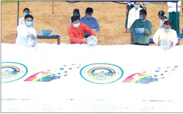
ချုပ် အမှုဆောင်များနှင့် သမဝါယမ ငါးမျိုးစိုက်ထည့်ခြင်းများ ဆောင်ရွက် မိသားစုဝင်များက ငါးမြစ်ချင်း ခဲ့ကြောင်း သိရသည်။

(၉၈) ကြိမ်မြောက် အပြည်ပြည်ဆိုင်ရာ သမဝါယမနေ့ အထိမ်းအမှတ်အဖြစ် ပဲခူးတိုင်းဒေသကြီး သမဝါယမ မိသားစုမှ စုပေါင်းငါးမျိုးများ စိုက် ထည့်ခြင်းအခမ်းအနားကို ယနေ့ နံနက်ပိုင်းက ပဲခူးမြို့ မင်းရေလှောင် တံခါး ကျင်းပသည်။ (ယာပုံ)