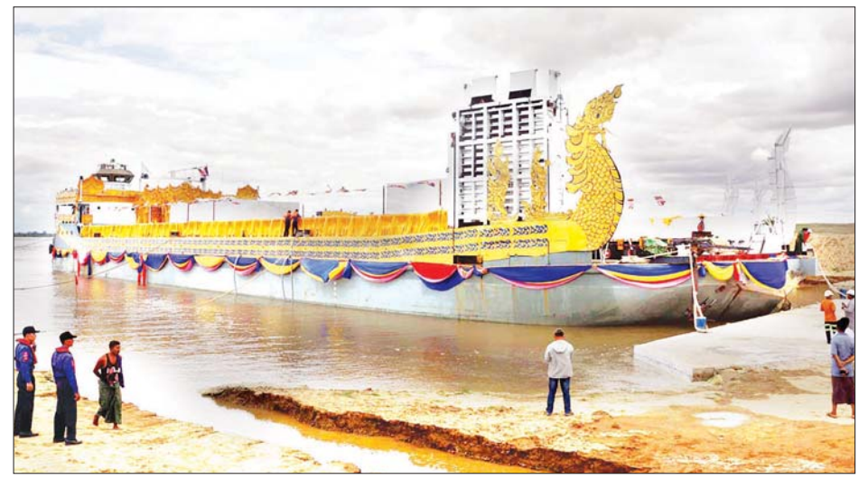
ဦးစီးချုပ်(ရေဗိုလ်မှူးကြီး) တင်ဆောင် ဆန်းနှင့် အရာရှိကြီးများက ကြည့်ရှု စစ်ဆေးခဲ့ကြသည်။ ပလ္လင်တော်အပိုင်း(၁) စကျင် ကျောက်တော်ကြီးမှာ တန်ချိန် ၆၈၄

အဆိုပါ သင်္ဘောဖောင်တော် ပေါ်ရှိ ဘူမိဗေဒမုဒြာထိုင်တော်မူ ကျောက်ဆစ်ဗုဒ္ဓရုပ်ပွားတော်မြတ် ကြီး၏ ပလ္လင်တော်အပိုင်း (၁) စကျင် ကျောက်တော်ကြီးနှင့် ပလ္လင်တော် အပိုင်း(၄) စကျင်ကျောက်တော်ကြီး သယ်ဆောင်လာခဲ့မှုများ၊ ပလ္လင်တော် စကျင်ကျောက်တော်ကြီးများ ခေတ္တ ကိန်းဝပ်စံပယ်တော်မူမည့် နေရာ များကို တပ်မတော်ကာကွယ်ရေး