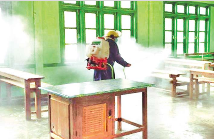
ဇွန် ၂၉ ရက်က စစ်ကိုင်းတိုင်းဒေသကြီး အင်းတော်မြို့နယ်၌ Quarantine Center အဖြစ် အသုံးပြုခဲ့သော စာသင်ကျောင်းများအား ကိုဗစ်-၁၉ ကာကွယ်ဆေးဖျန်းစဉ်။