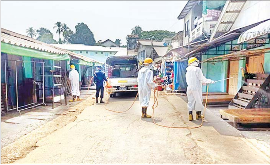
ဇွန် ၂၉ ရက်က တနင်္သာရီတိုင်းဒေသကြီး မြိတ်ခရိုင် ပုလောမြို့နယ် မြို့နယ်စည်ပင်သာယာရေးအတွင်း ကိုဗစ်-၁၉ ကာကွယ်ဆေးဖျန်းစဉ်။