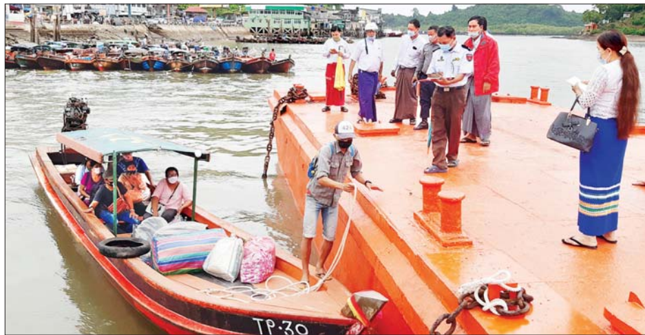
ထိုင်းနိုင်ငံမှ မြန်မာရွှေ့ပြောင်းအလုပ်သမားများ ကော့သောင်းမြို့သို့ ပြန်လည်ရောက်ရှိလာစဉ်။

ကော့သောင်း ဇူလိုင် ၄ တနင်္သာရီတိုင်းဒေသကြီး မြန်မာရွှေ့ပြောင်းအလုပ် သမားများ စိစစ် လက်ခံရေးနှင့် နေရပ်ပြန်လည်ပို့ဆောင် ရေးကော်မတီ၏ ကြီးကြပ်ညှိနှိုင်းမှုဖြင့် နေရပ်ပြန်မြန်မာ အလုပ်သမား အမျိုးသား ၁၄ ဦး၊ အမျိုးသမီး ၂၇ ဦး စုစုပေါင်း ၄၁ ဦး ဇူလိုင် ၃ ရက် ညနေပိုင်းက ထိုင်းနိုင်ငံတောင်ပိုင်း ရနောင်းမြို့မှတစ်ဆင့် မြန်မာနိုင်ငံ ကော့သောင်းမြို့သို့ ရေလမ်းခရီးဖြင့် ပြန်လည်ဝင်ရောက်လာခဲ့ကြရာ ယနေ့ အထိ ကော့သောင်းနယ်စပ်ဂိတ်မှ ပြန်လည်ဝင်ရောက် လာသည့် အလုပ်သမား ၉၇ ဦးရှိပြီ ဖြစ်ကြောင်း သိရသည်။ ပြန်လည်ဝင်ရောက်လာသည့် အလုပ်သမားများအား ကော့သောင်းခရိုင်နှင့် မြို့နယ် ကိုဗစ်-၁၉ ရောဂါ ကာကွယ်၊ ထိန်းချုပ်ရေးနှင့် အရေးပေါ်တုံ့ပြန်ရေးကော်မတီဝင် များ၊ ဌာနဆိုင်ရာများနှင့် NGO အဖွဲ့အစည်းများက စာမျက်နှာ ၃ ကော်လံ ၅ ❖