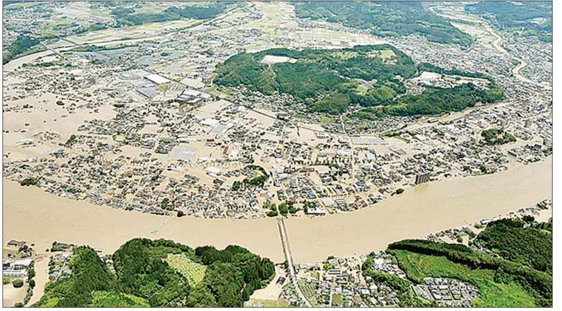
ကူမာမိုတိုခရိုင်တွင် ရေကြီးနေသည်ကို တွေ့ရစဉ်။