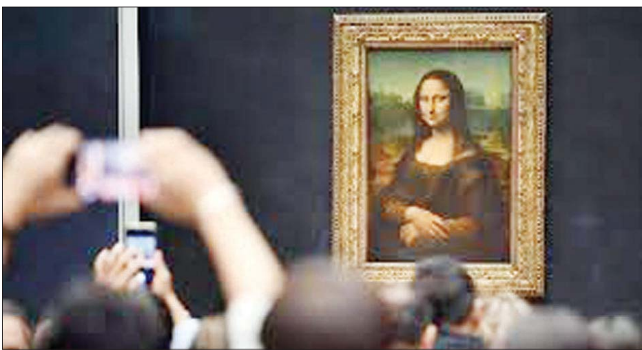
ပြင်သစ်နိုင်ငံရှိ ကမ္ဘာ့ကျော် လူဗာပြတိုက်အတွင်း မိုနာလီဆာ ပန်းချီကားရှေ့တွင် ဓာတ်ပုံရိုက်နေသူများကို တွေ့ရစဉ်။