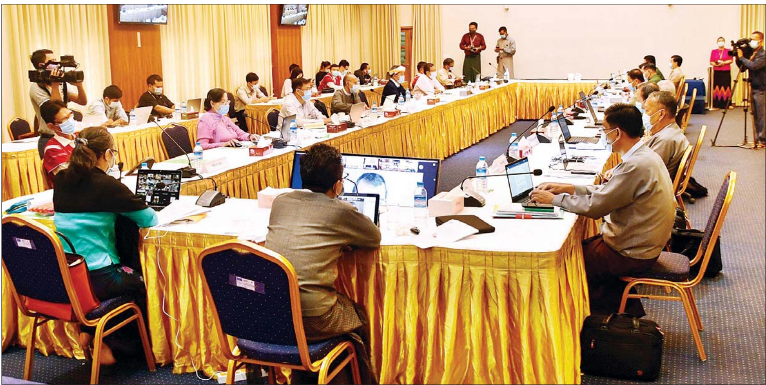
အစိုးရကိုယ်စားလှယ်များနှင့် NCA - S EAO တို့၏ ပဉ္စမအကြိမ် အလုပ်အဖွဲ့ညှိနှိုင်းအစည်းအဝေး ကျင်းပစဉ်။

ရန်ကုန် ဇူလိုင် ၄ အစိုးရ ကိုယ်စားလှယ်များနှင့် NCA လက်မှတ်ရေးထိုးထားသည့် တိုင်းရင်းသားလက်နက်ကိုင် အဖွဲ့အစည်း ကိုယ်စားလှယ်များ (NCA - S EAO)၏ ပဉ္စမအကြိမ် အလုပ်အဖွဲ့ ညှိနှိုင်းအစည်းအဝေးကို ယနေ့နံနက် ၁၀ နာရီက ရန်ကုန်မြို့၊ ရွှေလီလမ်းရှိ အမျိုးသား ပြန်လည်သင့်မြတ်ရေးနှင့် ငြိမ်းချမ်းရေးဗဟိုဌာန (NRPC)တွင် ဆက်လက်ကျင်းပခဲ့ပြီး ပြည်ထောင်စု ငြိမ်းချမ်းရေးညီလာခံ-(၂၁)ရာစု ပင်လုံ စတုတ္ထအစည်းအဝေး ကျင်းပရေး နှင့် ပတ်သက်၍ ဆောင်ရွက်သွားမည့် အစီအစဉ်များကို ဆွေးနွေးနိုင်ခဲ့သည်။ အစည်းအဝေးသို့ အစိုးရ ကိုယ်စားလှယ်များအဖြစ် အမျိုးသား ပြန်လည်သင့်မြတ်ရေးနှင့် ငြိမ်းချမ်း ရေးဗဟိုဌာန ဒုတိယဥက္ကဋ္ဌ ပြည် ထောင်စုရှေ့နေချုပ် ဦးထွန်းထွန်းဦး၊ ကာကွယ်ရေးဦးစီးချုပ်ရုံး (ကြည်း) မှ ဒုတိယဗိုလ်ချုပ်ကြီး ရာပြည့်၊ စာမျက်နှာ ၄ ကော်လံ ၁ ❖