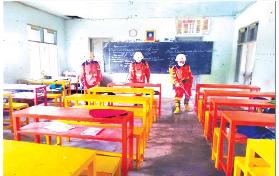
ဇွန် ၂၉ ရက်က မန္တလေးတိုင်းဒေသကြီး ပုသိမ်ကြီးမြို့နယ်အတွင်း စာသင်ကျောင်းများအား ကိုဗစ်-၁၉ ကာကွယ်ဆေးဖျန်းစဉ်။