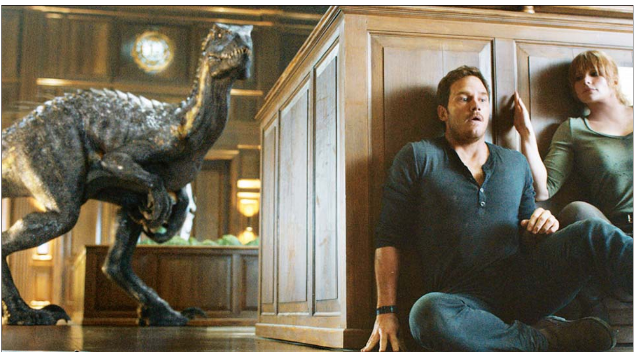
Jurassic World: Fallen Kingdom ရုပ်ရှင်ကားမှ ဇာတ်ဝင်ခန်းတစ်ခုကို တွေ့ရစဉ်။

“ရုပ်ရှင်တွေ အန္တရာယ်ကင်းကင်းနဲ့ ရိုက်ကူးနိုင်ဖို့အရေး စဉ်းစားမှုတွေ၊ အကြံပေးမှုတွေ၊ ဝေဖန်မှုတွေကတော့ အများကြီးပါပဲ။ တိကျသေချာတဲ့ ကာကွယ်ဆေးနဲ့ ကုသဆေးမပေါ်ထွက်လာမီအချိန်အထိ ရုပ်ရှင်လုပ်ငန်းကို ဘယ်လိုအန္တရာယ်ကင်းကင်း ပြန်စကြမလဲဆိုတာကိုတော့ သေချာပြောနိုင်ဖို့ အခက်တွေ့နေပါတယ်”