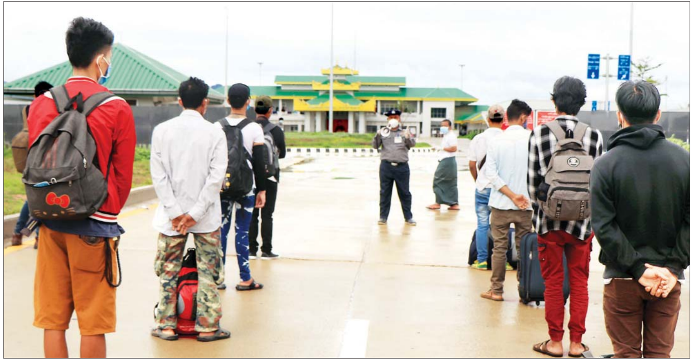
မြဝတီ အမှတ်(၂) ချစ်ကြည်ရေးတံတားမှ ပြန်လည် ဝင်ရောက်လာကြသူများကို တွေ့ရစဉ်။