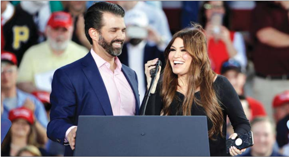
ဒေါ်နယ်ထရမ်ဂျွန်နီယာနှင့် ကင်ဘာလီဂေးရှင်း

ဝါရှင်တန် ဇူလိုင် ၄ အမေရိကန်သမ္မတ ဒေါ်နယ်ထရမ်၏ အကြီးဆုံးသားဖြစ်သူ ဒေါ်နယ်ထရမ် ဂျွန်နီယာ၏ ချစ်သူမိန်းကလေးတွင် ကိုဗစ် - ၁၉ ကူးစက်ခံထားရကြောင်း အမေရိကန် မီဒီယာများတွင် ဇူလိုင် ၃ ရက်က ဖော်ပြခဲ့ကြသည်။ ဖောက်ခံနည်းမှ ရုပ်သံ တင်ဆက် သူဟောင်း ကင်ဘာလီဂေးရှင်းသည် ဒေါ်နယ်ထရမ် ဂျွန်နီယာနှင့် တွဲနေကြ ပြီး အမေရိကန် သမ္မတ၏ ဇူလိုင်လ မိန့်ခွန်းကို နားထောင်ရန်နှင့် ရက်ရှိမေတောင်တွင် မီးရှူးမီးပန်း အလှူများကြည့်ရန် တောင်ဒါကိုတာ ပြည်နယ်သို့ ခရီးထွက်ခဲ့သည်။ ကင်ဘာလီ ဂေးရှင်းတွင် ကိုဗစ်-၁၉ ကူးစက်ခံထားရကြောင်း စစ်ဆေး တွေ့ရှိပြီးနောက် ၎င်းကို သီးခြားခွဲ ထားသည်။ သမ္မတနှင့် အနီးကပ် ဆက်ဆံမှု ရှိသည့်ဟုယူဆရသူများကို ဆေးစစ်မှု များပြုလုပ်ပြီးနောက် ကင်ဘာလီ ဂေးရှင်းတွင် ကူးစက်ခံထားရမှုနန်း