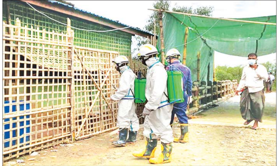
ဇွန် ၂၉ ရက်က ရခိုင်ပြည်နယ် မောင်တောမြို့ရှိ အမှတ်(၁)နယ်စပ်အဝင်/အထွက်စခန်းတို့တွင် ကိုဗစ်-၁၉ ကာကွယ်ဆေးဖျန်းစဉ်။