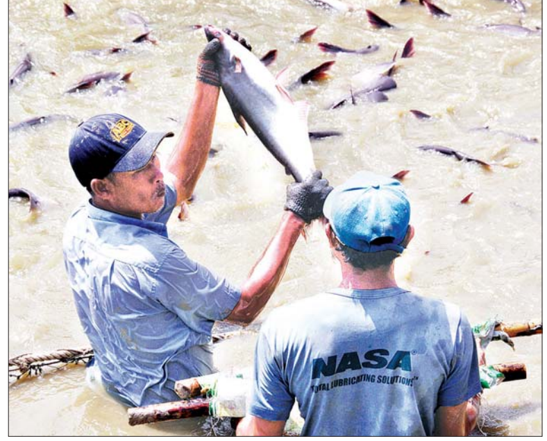
ပြည်ပ ဈေးကွက်ဝင် ငါးတန်အား ပြသစဉ်။