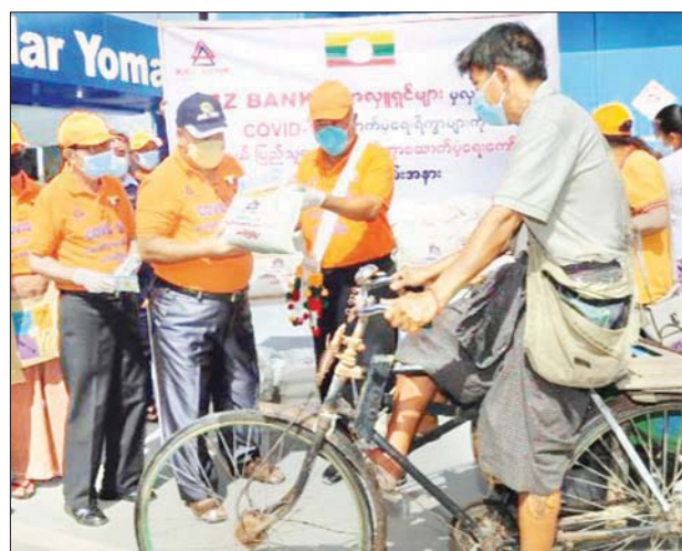
ငွေကျပ် ၁၀၀၀၀ စီတို့ကို လှူဒါန်း၍ လှေဆိပ်သို့ ရောက်ရှိပြီး စက်လှေကမ္ဘောဇဘဏ် နာယကက အဆိုပါ ကျောင်းဘက်စုံဖွံ့ဖြိုးတိုးတက်ရေးအတွက် ဆရာတော်ထံ အလှူငွေကျပ် သိန်း ၃၀၀ ကို ဆက်ကပ်လှူဒါန်းသည်။ ထိုမှတစ်ဆင့် ပြည်နယ်ဝန်ကြီးချုပ်နှင့်အဖွဲ့သည် ရွှေညောင်ဘူတာသို့ ရောက်ရှိပြီး ကုန်တင်ကုန်ချလုပ်သား ၈၀ နှင့် အခြေခံပြည်သူများအား စားနပ်ရိက္ခာထုတ်ပေးခြင်း၊ ဗီတာမင်စီ အချို့ရည်ဘူးများနှင့် တစ်ဦးလျှင် ငွေကျပ် ၁၀၀၀၀ စီတို့ကိုလည်း ကောင်း၊ ညောင်ရွှေမြို့ အင်းလေး ငွေကျပ် ၁၀၀၀၀ စီတို့ကို ထောက်ပံ့

တောင်ကြီး ဇူလိုင် ၃ ရှမ်းပြည်နယ်ဝန်ကြီးချုပ် ဒေါက်တာလင်းထွဋ်နှင့် ပြည်နယ်အစိုးရအဖွဲ့ဝင် ဝန်ကြီးများ၊ ရှမ်းပြည်နယ် လွှတ်တော်ဥက္ကဋ္ဌ ဦးစိုင်းလုံးဆိုင်၊ ပြည်သူ့လွှတ်တော်ကိုယ်စားလှယ် ဒေါက်တာဒေါ်သန်းဌေးနှင့် ဦးနေမျိုး၊ ခရိုင်၊ မြို့နယ်အထွေထွေအုပ်ချုပ်ရေးဦးစီးဌာနမှ တာဝန်ရှိသူများ၊ ကမ္ဘောဇဘဏ် နာယက ဦးအောင်ကိုဝင်း၊ အကြီးတန်းအုပ်ချုပ်မှုဒါရိုက်တာ ဦးညိုမြင့်နှင့် ရှမ်းပြည်နယ် ပြည်သူ့လူထု စားနပ်ရိက္ခာထောက်ပံ့ရေးကော်မတီဝင်များနှင့် ပရဟိတအဖွဲ့ဝင်များသည် ယနေ့နံနက်ပိုင်းက ရွှေညောင်၊ ညောင်ရွှေမြို့ရှိ ကုန်တင်ကုန်ချလုပ်သားများ၊ အနွေးယာဉ်၊ လက်တွန်းလှည်း လုပ်သားများနှင့် စက်လှေလုပ်သား အခြေခံပြည်သူများ လက်ဝယ်အရောက် စားနပ်ရိက္ခာများ သွားရောက် ထောက်ပံ့လှူဒါန်းခဲ့သည်။ ရှေးဦးစွာ ပြည်နယ်ဝန်ကြီးချုပ်နှင့် အဖွဲ့သည် အေးသာယာမြို့ရှိ ရွှေတောင်တန်း ပရဟိတဂေဟာသို့ ရောက်ရှိပြီး ဆရာ ဆရာမများနှင့် ကျောင်းသား ကျောင်းသူ ၃၀၀ တို့အား စားနပ်ရိက္ခာထုတ်ပေးခြင်းနှင့် တစ်ဦးလျှင်