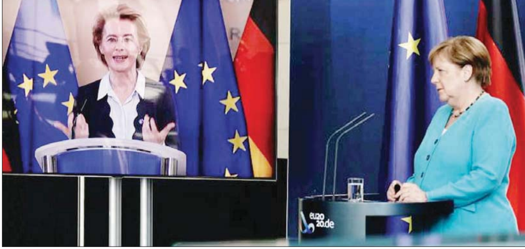
ဥရောပကော်မရှင်ဥက္ကဋ္ဌ အာဆူလာဗွန်ဒါလီယန်နှင့် ဂျာမနီဝန်ကြီးချုပ်တို့ ဆွေးနွေးနေကြစဉ်။

နိုင်ငံများကမူ အဖွဲ့ဝင်နိုင်ငံများကို ကူညီရန် အခွန်ထမ်း ပြည်သူ များ၏ အခွန်ငွေကို အသုံးပြုခြင်းအတွက် သတိကြီးကြီးထားနေ ကြသည်။ အင်န်အိတ်ချ်ကေ