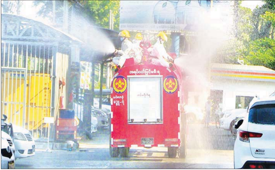
ဇွန် ၂၈ ရက်က ရန်ကုန်တိုင်းဒေသကြီး မင်္ဂလာဒုံမြို့နယ်အတွင်း ကိုဗစ်-၁၉ ကာကွယ်ဆေးဖျန်းစဉ်။