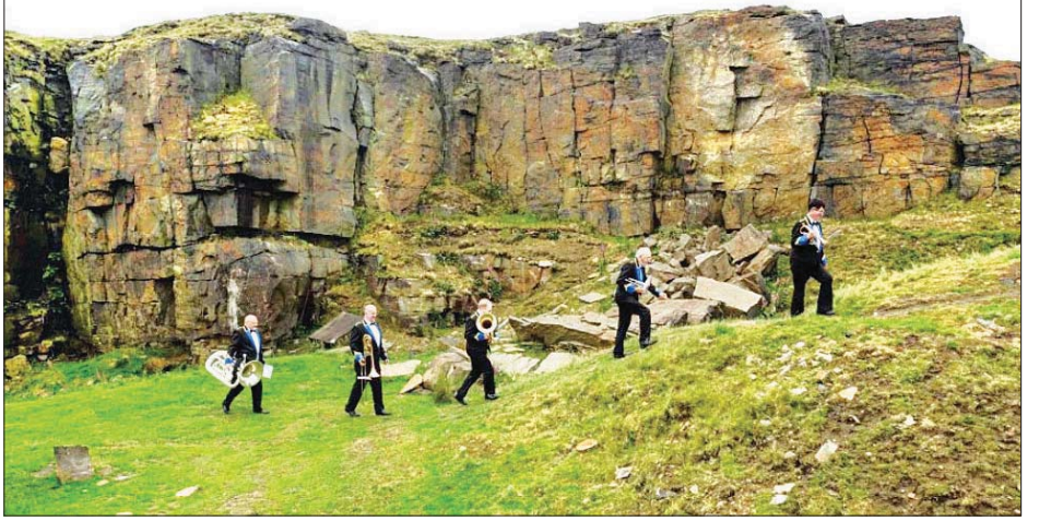
Meltham and Me Hham Mills ဂီတအဖွဲ့လေ့ကျင့်နေမှုကို တွေ့ရစဉ်။

ဗြိတိန်နိုင်ငံသည် ကိုဗစ် - ၁၉ ကူးစက်မှုဒဏ်ကို ဥရောပတွင် ဆိုးရွားစွာ ခံစားခဲ့ရပြီး မတ်လနှောင်းပိုင်းမှ စတင်ကာ နေအိမ်၌သာနေရန် အမိန့်ကို ပယ်ဖျက်ပေးခဲ့ သည်။ ယခုသီတင်းပတ်အတွင်း စားသောက်ဆိုင်များ၊ ပြတိုက်များ ပြန်လည်ဖွင့်လှစ်ခွင့်ပေးမည် ဖြစ်သော်လည်း