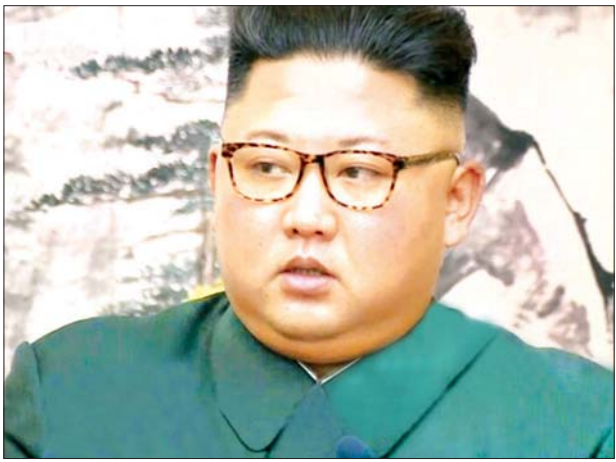
မြောက်ကိုရီးယားခေါင်းဆောင် ကင်ဂျုံအန်း

မြောက်ကိုရီးယား ခေါင်းဆောင် ကင်ဂျုံအန်းသည် ကိုဗစ် -၁၉ ရောဂါ ကူးစက်ပျံ့နှံ့မှုကို ကာကွယ်တားဆီး ရန် အပြင်းအထန် ကြိုးစားဆောင်ရွက် ကြရန်လိုကြောင်း တိုက်တွန်းပြော ကြားလိုက်သည်ဟု မြောက်ကိုရီးယား နိုင်ငံပိုင်မီဒီယာတွင် ဖော်ပြလိုက် သည်။ မြောက်ကိုရီးယား ခေါင်းဆောင် ကင်သည် ယမန်နေ့က ပေါ်လစီဗျူရို အစည်းအဝေးသို့ တက်ရောက်ခဲ့ ကြောင်း မြောက်ကိုရီးယားနိုင်ငံ၏ အာဏာရပုဂ္ဂိုလ် သတင်းစာဖြစ်သော ရိုဒွန်ဆင်မွန်တွင် ဇူလိုင် ၃ ရက်က ဖော်ပြလိုက်သည်။