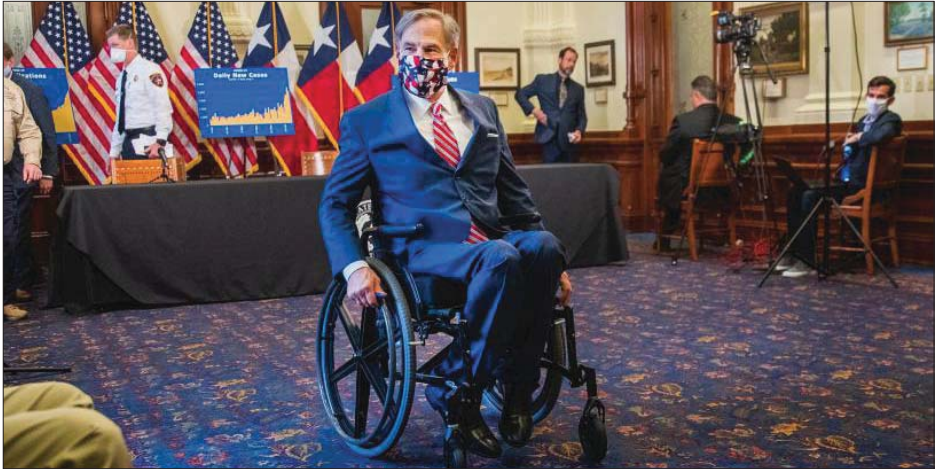
တက္ကဆက်ပြည်နယ်အုပ်ချုပ်ရေးချုပ် ဂရက်ဂျီအက်ဘော့

ယင်းသို့ အမိန့်ထုတ်ပြီးနောက် ဟူးစတန်မြို့တော်ဝန် ဆေဗက်စတာ တန်နာကလည်း ယင်းအမိန့်ကို ထောက်ခံကြောင်းပြောသည်။ ကိုဗစ်- ၁၉ ထိန်းချုပ်နိုင်ရေးအတွက် ပိုမို တင်းကျပ်သည့် စည်းကမ်းများချမှတ် ရန် ပြည်နယ်အုပ်ချုပ်ရေးထံ ဟူးစတန် မြို့တော်ဝန်က စာရေးတောင်းဆို ခဲ့သည်ဟုလည်း ဒေသတွင်း မီဒီယာ များတွင် ဖော်ပြထားသည်။ ဇူလိုင် ၂ ရက်တွင် တက္ကဆက်ပြည်နယ်၌ ကိုဗစ်- ၁၉ ကူးစက်ခံရသူ ၁၇၅၉၇၇ ဦးရှိပြီး သေဆုံးသူအရေအတွက်မှာ ၂၅၅၅ ဦးရှိသည်ဟု တက္ကဆက်ပြည်နယ် ကျန်းမာရေးနှင့်လူသား အရင်းအမြစ် ဌာနက ပြောသည်။ ဆင်ဟွာ