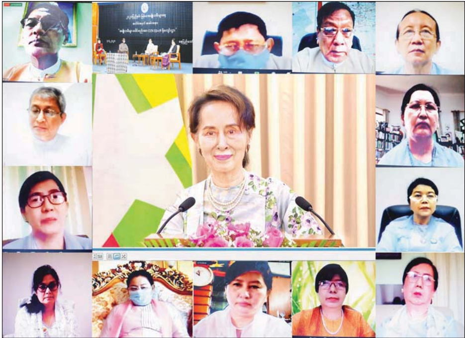
အမျိုးသမီးများနေ့ အထိမ်းအမှတ် နိုင်ငံတော်၏အတိုင်ပင်ခံပုဂ္ဂိုလ်က ပြောကြားသည့် မိန့်ခွန်းသံဝက်လွှာကို video clip ဖြင့် ထုတ်လွှင့်စဉ်။

အိမ်တွင်မိသားစု ပြုစုစောင့်ရှောက်ရသော တာဝန်ကို အမျိုးသမီးအများစုက တာဝန်ယူဆောင်ရွက်ရလေ့ ရှိပါကြောင်း၊ မိသားစုဆိုသည်မှာ လူမှုအသိုင်းအဝိုင်း၏ အခြေခံဖြစ်ပါကြောင်း၊ မိသားစုစိတ်ဓာတ်က ပူးပေါင်းဆောင်ရွက်ကြရန် အရေးကြီးပါကြောင်း၊ မိသားစုစိတ်ဓာတ်နှင့် ကိုယ်ချင်းစာတရားသည် မြန်မာလူမျိုးများ၏ အခြေခံစံနှုန်းများဖြစ်ပါကြောင်း၊ မိသားစုစိတ်ဓာတ်၊ ကိုယ်ချင်းစာတရားနှင့်အတူတကွ ကြိုးစားဆောင်ရွက်ကြမည်ဆိုပါက ကိုဗစ်-၁၉ ၏ နောက်ဆက်တွဲ အခက်အခဲများကို ကျော်လွှားနိုင်ကြလိမ့်မည်ဟု ယုံကြည်ပါကြောင်း၊ ထို့ပြင် အရေးကြီးသည့် တစ်ချက်မှာ ရင်ဆိုင်ရသည့် အခြေအနေများနှင့် လိုက်လျောညီထွေဖြစ်ရန် ပြောင်းလဲနိုင်စွမ်းပင်ဖြစ်ပါကြောင်း၊ ကိုဗစ်-၁၉ ကြောင့် စီးပွားရေးလုပ်ငန်းများ၊ လုပ်ငန်းဆောင်ရွက်မှု၊ လူမှုရေး ဆောင်ရွက်မှုပုံစံများကို