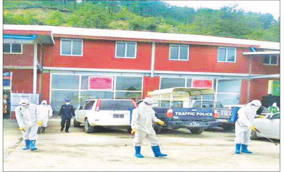
ဇွန် ၂၈ ရက်က ချင်းပြည်နယ် ဟားခါးမြို့နယ်အတွင်း ကိုဗစ်-၁၉ ကာကွယ်ဆေးဖျန်းစဉ်။