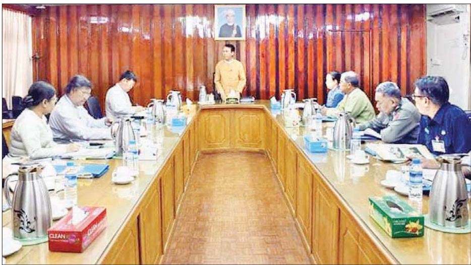
တည်ဆောက်ခွင့် ၁၁ လုံး၊ တည်းခိုရိပ်သာတည်ဆောက်ခွင့် နှစ်လုံး၊ ခရီးလှည့်လည်ရေးလုပ်ငန်းလိုင်စင် (ပြည်တွင်း/ပြည်ပ) ၁၃၇ ခုကို အတည်ပြုခွင့်ပြုပေးခဲ့သည်။ ၂၀၂၀ ပြည့်နှစ်အတွင်း ဟိုတယ်နှင့် တည်းခိုရိပ်သာကဏ္ဍတွင် စုစုပေါင်း မြန်မာနိုင်ငံသားနှင့် နိုင်ငံခြားသားရင်းနှီးမြှုပ်နှံမှု မတည်ငွေနှင့် ရင်းနှီးငွေပမာဏ စုစုပေါင်းမှာ ကျပ်သန်း ၇၁၅၉၇ ဒသမ ၁ နှင့် အမေရိကန် ဒေါ်လာ ၃၈ ဒသမ ၈၆၅ သန်းဖြစ်ပြီး အလုပ်အကိုင်အခွင့်အလမ်းပေါင်း ၁၂၀ အတွက် ဖန်တီးပေးနိုင်ခဲ့သည်။

ထို့နောက် ကော်မတီအတွင်းရေးမှူးက အစီအစဉ်များ အတိုင်း ဆက်လက်ရှင်းလင်းတင်ပြခဲ့ပြီး ဥက္ကဋ္ဌ ဒုတိယဥက္ကဋ္ဌနှင့် ကော်မတီဝင်များက ဆွေးနွေးအတည်ပြုခဲ့ကြသည်။ အဆိုပါအစည်းအဝေးတွင် မြန်မာနိုင်ငံသားရင်းနှီးမြှုပ်နှံမှုဖြစ်သော ဟိုတယ်လုပ်ငန်းလိုင်စင် တစ်ခု၊ တည်းခိုရိပ်သာ လိုင်စင် သုံးခု၊ စုစုပေါင်း အခန်း (၉၃) ခန်း၊ ဟိုတယ်တည်ဆောက်ခွင့် နှစ်လုံး၊ တည်းခိုရိပ်သာ တစ်လုံးတို့ကို အတည်ပြုခွင့်ပြုပေးခဲ့ပြီး ဟိုတယ်/တည်းခိုရိပ်သာလုပ်ငန်းအတွက် ခွင့်ပြုမတည်ငွေနှင့် ရင်းနှီးငွေပမာဏ စုစုပေါင်းမှာ ကျပ်သန်း ၁၀၁၃၀ ဖြစ်သည်။ အတည်ပြုပေးခဲ့သော လုပ်ငန်းလိုင်စင်အားလုံးမှ ပြည်တွင်းအလုပ်အကိုင်အခွင့်အလမ်းပေါင်း ၅၂ ဦးအတွက် ဖန်တီးပေးနိုင်မည်ဖြစ်သည်။ လိုင်စင်ဆိုင်ရာကိစ္စရပ်များ အတည်ပြုပေးပြီးနောက် ဆက်လက်၍ ခရီးသွားလုပ်ငန်း ဖွံ့ဖြိုးတိုးတက်ရေးအတွက် လိုအပ်သည်များ စီမံဆောင်ရွက်နိုင်ရန် ဆွေးနွေးခဲ့ကြသည်။ ကျင်းပပြီးစီးခဲ့သည့် အစည်းအဝေးအမှတ်စဉ် (၁/၂၀၂၀) မှ (၄/၂၀၂၀) အထိ ရန်ကုန်တိုင်းဒေသကြီး ဒေသဆိုင်ရာ ခရီးသွားလုပ်ငန်းကော်မတီအနေဖြင့် ဟိုတယ်လုပ်ငန်းလိုင်စင် ၁၇ လုံး၊ အခန်း ၁၃၇၀၊ ဟိုတယ်