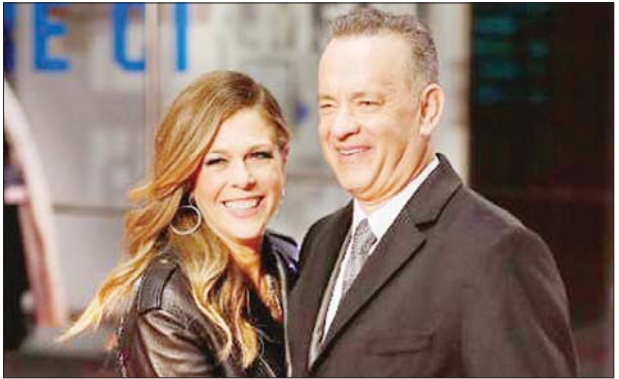
ရုပ်ရှင်မင်းသားတွမ်ဟန်ခ်နှင့် ဇနီးဖြစ်သူ ရီတာဝေလ် ဆင်