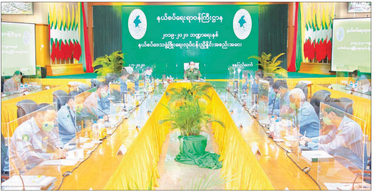
ပြည်ထောင်စုဝန်ကြီး ဒုတိယဗိုလ်ချုပ်ကြီး ရဲအောင် နယ်စပ်ရေးရာဝန်ကြီးဌာန၏ နယ်စပ်ဒေသဖွံ့ဖြိုးရေးလုပ်ငန်းညှိနှိုင်းအစည်းအဝေး (၁/၂၀၂၀) တွင် အမှာစကားပြောကြားစဉ်။

ထို့နောက် ပြည်ထောင်စုဝန်ကြီးက ဒေသဖွံ့ဖြိုးမှုကြီးကြပ်ရေးမှူးများ အနေဖြင့် နိုင်ငံတော်အစိုးရ ကျန်းမာရေးနှင့် အားကစားဝန်ကြီးဌာန၊ တိုင်းဒေသ ကြီး၊ ပြည်နယ်အစိုးရတို့က ထုတ်ပြန်သည့် ကိုဗစ်-၁၉ နှင့်သက်ဆိုင်သော အမိန့်နှင့် ညွှန်ကြားချက်များကို တိတိကျကျလိုက်နာပြီး ကိုဗစ်-၁၉ အလွန်တွင် ဝန်ကြီးဌာနအနေဖြင့် New Normal ပုံစံဖြင့် ကိုဗစ်-၁၉ နှင့် အတူယှဉ်တွဲ