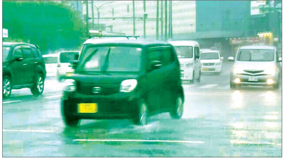
ဂျပန်နိုင်ငံ၏ ဒေသအချို့တွင် မိုးရွာသွန်းလျက်ရှိရာ မော်တော်ယာဉ်များ မိုးရွာထဲတွင် သွားလာနေသည်ကို တွေ့ရစဉ်။