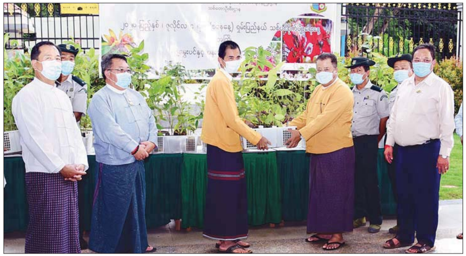
ပြည်နယ်ဝန်ကြီးချုပ် ဒေါက်တာလင်းထွဋ် ပျိုးပင်များကို လက်ခံယူစဉ်။