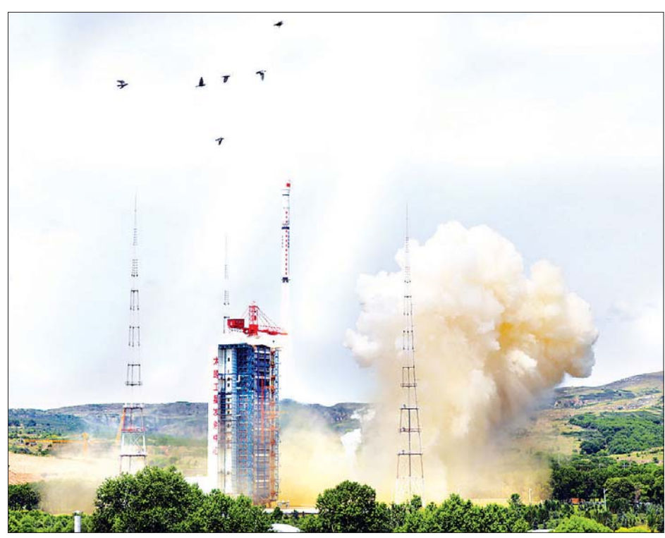
တရုတ်နိုင်ငံမြောက်ပိုင်း ဆန်းရှီးပြည်နယ်ရှိ ထိုက်ယွမ်ဂြိုဟ်တုလွှတ်တင်ရေးစင်တာမှ အိတ်ချ်ပိုင်-၁ ဒီဂြိုဟ်တု တစ်စင်းကို ဇူလိုင် ၃ ရက်က အောင်မြင်စွာ လွှတ်တင်နေစဉ်။

ထိုက်ယွမ် ဇူလိုင် ၃ တရုတ်နိုင်ငံက ရုပ်ထွက်မြင့်မားသော ဘက်စုံစနစ်ပုံရိပ်ဖတ် အဝေးထိန်း အာရုံခံ ဂြိုဟ်တုတစ်လုံးကို လွှတ်တင် လိုက်ကြောင်း သိရသည်။