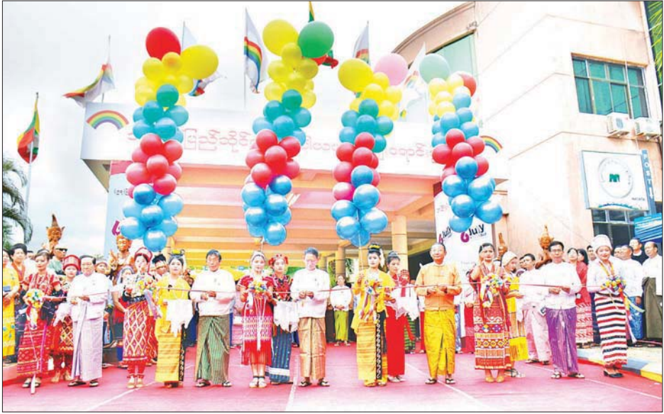
ယမန်နှစ်က (၉၇) ကြိမ်မြောက် အပြည်ပြည်ဆိုင်ရာသမဝါယမနေ့ အခမ်းအနား ကျင်းပစဉ်။

နေပြည်တော် ဇူလိုင် ၃ စိုက်ပျိုးရေး၊ မွေးမြူရေးနှင့် ဆည်မြောင်းဝန်ကြီးဌာန သမဝါယမဦးစီးဌာနသည် နိုင်ငံတကာအဖွဲ့အစည်းများနှင့် ပူးပေါင်းဆောင်ရွက်လျက်ရှိပြီး နှစ်စဉ်အပြည်ပြည်ဆိုင်ရာသမဝါယမနေ့အခမ်းအနား ကျင်းပလျက်ရှိရာ ယခုနှစ် (၉၈) ကြိမ်မြောက် အခမ်းအနားကို ကိုဗစ်-၁၉ ရောဂါအခြေအနေကြောင့် Video Conferencing ဖြင့် ဇူလိုင် ၄ ရက်တွင် ကျင်းပသွားမည်ဖြစ်ကြောင်း သိရသည်။