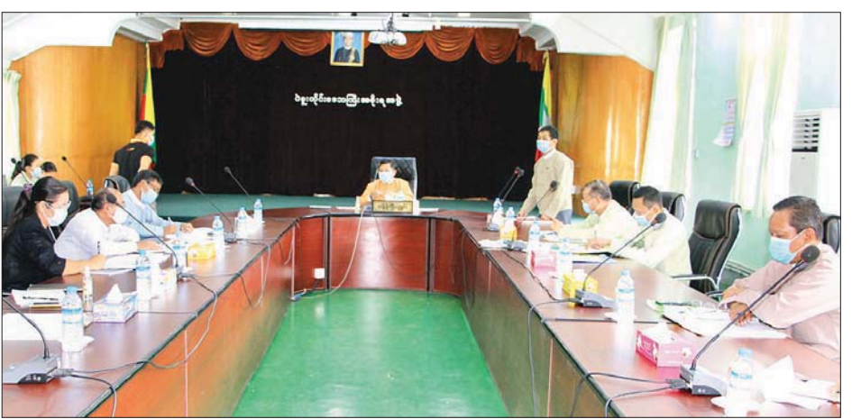
တိုင်းဒေသကြီးဝန်ကြီးချုပ် ဦးဝင်းသိန်း MSME ဖွံ့ဖြိုးတိုးတက်ရေးလုပ်ငန်းညှိနှိုင်းစည်းစဉ်းအစည်းအဝေးတက်ရောက် ဆွေးနွေးစဉ်။

Sustainable Development Plan (MSDP) မြန်မာနိုင်ငံ၏ ရေရှည်တည်တံ့ခိုင်မြဲပြီး ဟန်ချက်ညီသော ဖွံ့ဖြိုးတိုးတက်မှု စီမံကိန်း ရည်မှန်းချက်များ အကောင်အထည်ဖော်ရာတွင် အသေးစား၊ အငယ်စားနှင့် အလတ်စား စီးပွားရေးလုပ်ငန်း များကို တစ်ဖက်တစ်လမ်းမှ မြှင့်တင်ပေးရန် လိုအပ်မည် ဖြစ်ကြောင်း၊ MSME လုပ်ငန်းများ အဆင့်မြှင့်တင်ခြင်းနှင့် ရေရှည်ရပ်တည်နိုင်ရေးအတွက် ချေးငွေရရှိနိုင်ရေးကို လည်း ထည့်သွင်းဆောင်ရွက်ပေးရန် လိုအပ်ကြောင်း ပြောကြားသည်။ ထို့နောက် တက်ရောက်လာသည့် အသေးစား၊ အငယ်စား နှင့် အလတ်စား စီးပွားရေးလုပ်ငန်းများ ဖွံ့ဖြိုးတိုးတက်နိုင် ရေး အေဂျင်စီအဖွဲ့ (MSME) အဖွဲ့ဝင်များက လုပ်ငန်းမှတ်ပုံ တင်ရေး၊ အသင်းဝင်ကတ်ရရှိနိုင်ရေး၊ ချေးငွေထုတ်ချေး နိုင်ရေးတို့ကို အကြံပြုတင်ပြဆွေးနွေးကြရာ တိုင်းဒေသကြီး ဝန်ကြီးချုပ်က လိုအပ်သည်များ ဖြည့်စွက်ရင်းလင်း ပြောကြားသည်။