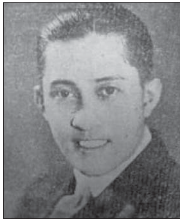
တက္ကသိုလ်နေဝင်း