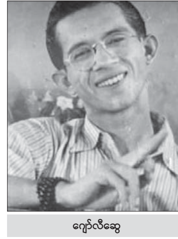
ကျော်လီဆွေ