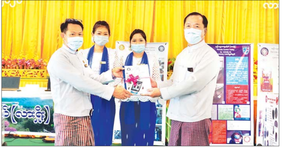
ကိုဗစ်-၁၉ ရောဂါကာကွယ်ရေး အထောက်အကူပြုပစ္စည်းများ ရှမ်းပြည်နယ်အစိုးရအဖွဲ့ထံသို့ လွှဲပြောင်း ပေးအပ်စဉ်။

ပိုးသတ်အခန်း သုံးလုံး၊ အဝေးထိန်းထရေဂျီလီ သုံးလုံး၊ အဝေးထိန်းပိုးသတ်ဆေးဖျန်းစက် တစ်လုံး၊ လားရှိုး ကွန်ပျူတာတက္ကသိုလ်က အလိုအလျောက်အဖွင့်အပိတ် ပြုလုပ်နိုင်သည့် ဆင်ဆာစနစ်ပါ အမှိုက်ပုံးများနှင့် စာမျက်နှာ ၁၇ ကော်လံ ၁ ♦