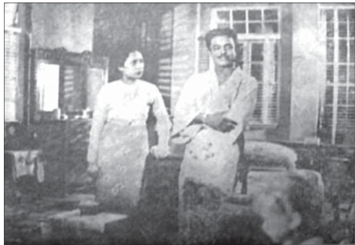
ဒေါက်တာ အောင်ကျော်ဦးမှ ...မောင်မောင်တာ...မေသစ်