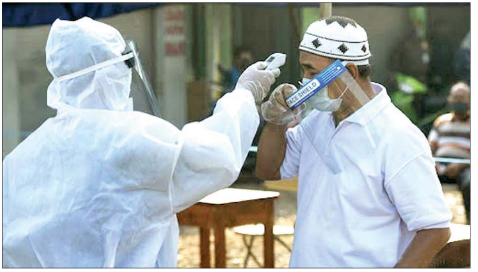
ကိုဗစ်-၁၉ ကာကွယ်ထိန်းချုပ်ရေးအတွက် အင်ဒိုနီးရှားပြည်သူတစ်ဦးကို ကိုယ်အပူချိန်တိုင်းတာ စစ်ဆေးစဉ်။