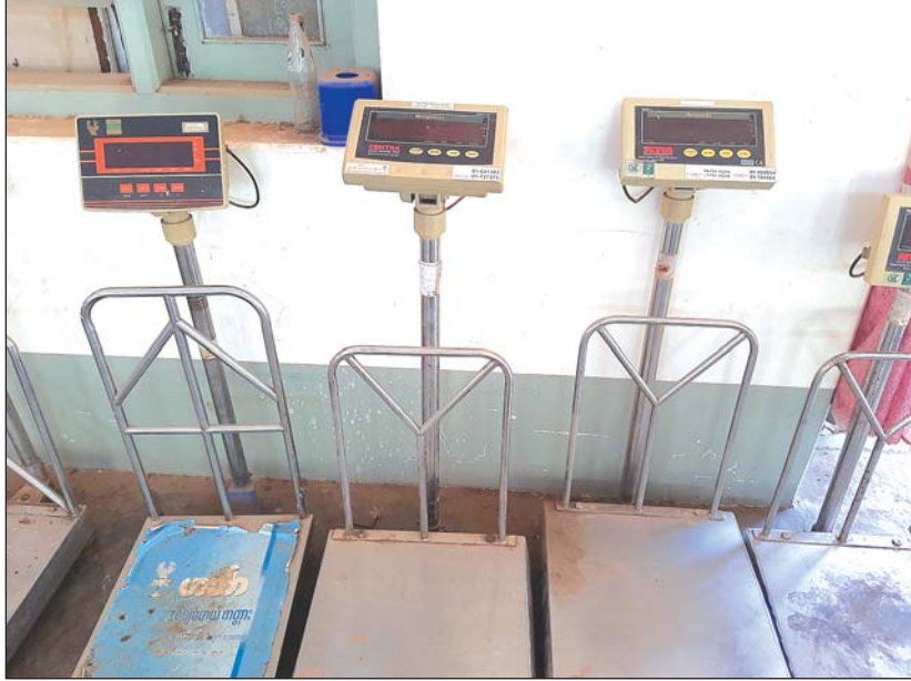
ပွဲရုံတစ်ခုတွင် အသုံးပြုနေသော ဒစ်ဂျစ်တယ်ကတ္တားများ

"တချို့သော မသမာတဲ့ပွဲရုံတွေ၊ ကုန်သည် တွေက ကတ္တားမမှန်ဘဲ လုပ်စားတာတွေရှိနေတယ် လို့ ကြားနေရတယ်။ မကွေးကိုလာရောင်းတဲ့ပစ္စည်း မှန်သမျှ စံယူနစ်စနစ်နဲ့ ချိန်ပေးနိုင်ဖို့ ဒီနေ့လုပ် ဆောင်ကြတာပါ။ ကုမ္ပဏီတွေက ကတ္တားတွေကို စစ်ပြီးရင် အလေးချိန်စနစ်ကို တာဝန်ယူရမယ်။ စတစ်ကာတွေကပ်ရမယ်။ ကုန်စည်ခိုင်ကို စာရင်း တွေပို့ရမယ်။ စစ်ဆေးထားခြင်းမရှိဘဲ ကတ္တားတွေနဲ့ ရောင်းဝယ်ခွင့်မပြုတော့ပါဘူး"ဟု မကွေးတိုင်း ဒေသကြီး ကုန်သည်များနှင့် စက်မှုလက်မှုလုပ်ငန်း