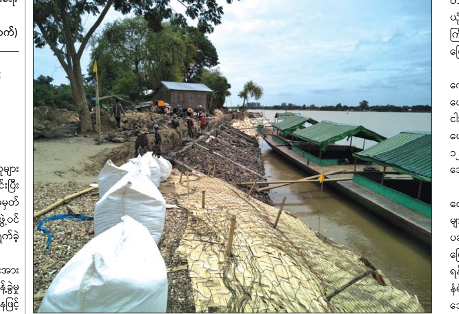
ပခန်းငယ်ကျေးရွာမှ ကျောက်စီတံ တည်ဆောက်ရေးလုပ်ငန်းခွင်

ရှေးဟောင်းစေတီပုထိုးများကို ကမ်းပြိုကျရာတွင် ပါဝင်နိုင်သည့် ဘေးအန္တရာယ်မှ ကာကွယ်နိုင်မည် ဖြစ်ကြောင်း သိရသည်။ "ပခန်းငယ်နဲ့ ချစ်သူရွာဘက်မှာ ကမ်းတွေ က လှိုက်ပြီး ပြိုလာတာကို တွေ့ရပါတယ်။ ပခန်းငယ်ရွာရော ချစ်သူရွာရောမှာ ဒီလိုသာ တောက်လျှောက်ပြိုလို့ရှိရင် ရွာတွေအကုန်ရွာမယ့် လက္ခဏာ ရှိပါတယ်။ ဒါ့ကြောင့် ကမ်းပြိုနေတဲ့နေရာ အနောက်ဘက် ကိုက် ၁၀၀ လောက်မှာ ပခန်း မင်းကြီးဦးရန်ဝေး တည်ဆောက်ခဲ့တဲ့ ကျွန်းကျောင်း တော်ကြီးရှိပါတယ်။ တကယ်လို့သာ ကမ်းပြိုခဲ့ရင် အဲဒီနေရာကြီးက ပါသွားမှာပါ။ ဒါ့ကြောင့်မို့လို့ ဒီဟာ လေးကို ကာကွယ်ထိန်းသိမ်းဖို့ ရေတာတာရိုက် တာပါ။ လာမယ့် ရေတာတာလာတဲ့အချိန်မှာ ကမ်းပြို တာတွေကို ကာကွယ်နိုင်လိမ့်မယ်လို့ ဦးလေးတို့ ယုံကြည်ပါတယ်"ဟု ရေစကြိုမြို့နယ် တိုင်းဒေသ ကြီးလွှတ်တော်ကိုယ်စားလှယ် ဦးတင်သောင်းက ပြောသည်။ ပခန်းမင်းကြီး ဦးရန်ဝေးသည် ပခန်းငယ် ကျောင်းတော်ကြီးကို အပြစ် အနာ အမှက် မပါသည့် ပေ ၂၀၀ မှ ပေ ၁၆၀ အထိ အရှည်ရှိပြီး လုံးပတ် ငါးပေမှ ရစ်ပေကျော်အထိရှိသည့် ကျွန်းတိုင်လုံး ပေါင်း ၃၃၂ တိုင်နှင့် တည်ဆောက်ခဲ့ခြင်းဖြစ်ပြီး ၁၂၁၈ ခုနှစ်မှ ၁၂၂၆ ခုနှစ်အထိ ခုနစ်ကျော်ကြာ အောင် တည်ဆောက်ခဲ့ခြင်းဖြစ်ကြောင်း သိရသည်။ အဆိုပါ ကျွန်းကျောင်းတော်ကြီးနှင့် ကျောင်း တော်ကြီးဝင်းအတွင်းရှိ ရှေးဟောင်း စေတီပုထိုး များကို ကမ်းပြိုကျသည့်အန္တရာယ်မှ ကာကွယ်ရန်နှင့် ပခန်းငယ်ကျေးရွာနှင့် ချစ်သူကျေးရွာတို့ရှိ ကျေးရွာ မြေစရိယာများ ကမ်းပြိုသည့်အန္တရာယ်မှ ကာကွယ် ရန်အတွက် ဘိုးပိုင်အခြေပြု ကျောက်စီမြေထိန်း နံရံနှင့် မြေထိန်းတံ တည်ဆောက်ခြင်းကို တိုင်း ဒေသကြီး ခွင့်ပြုရန်ပုံငွေ ကျပ်သန်း ၁၀၀ ဖြင့် ဆောင် ရွက်ခြင်းဖြစ်ကြောင်း သိရသည်။ အိမ်မွန်ဆွေ(ရေစကြို)