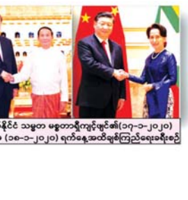
တရုတ်နိုင်ငံ သမ္မတ မစ္စတာရှီကျင့်ဖျင်၏(၁၇-၁-၂၀၂၀)ရက်နေ့မှ (၁၈-၁-၂၀၂၀) ရက်နေ့အထိချစ်ကြည်ရေးခရီးစဉ်

တရုတ်နိုင်ငံသမ္မတမစ္စတာရှီကျင့်ဖျင်သည်(၁၇-၁-၂၀၂၀)ရက်နေ့မှ(၁၈-၁-၂၀၂၀)ရက်နေ့အထိ မြန်မာနိုင်ငံသို့ လာရောက်ခဲ့သည့် ချစ်ကြည်ရေးခရီးစဉ်အတွင်း ထုတ်ပြန်သည့် မြန်မာ-တရုတ်နှစ်နိုင်ငံ ပူးတွဲကြေညာချက်တွင် ရခိုင်ပြည်နယ်ရှိအသိုက်အဝန်းအားလုံးအတွက် ဖွံ့ဖြိုးတိုးတက်ရေး၊ တည်ငြိမ်ရေး၊ ငြိမ်းချမ်းရေးတို့ကို မြှင့်တင်ရန်နှင့် လူသားချင်းစာနာ ထောက်ထားမှုဆိုင်ရာကိစ္စရပ်များ၊ နေရပ်စွန့်ခွာသူများ ပြန်လည်လက်ခံရေးနှင့်ပြန်လည်နေရာချထားရေးလုပ်ငန်းစဉ်များတွင်ဆက်လက်ကူညီသွားမည်ဖြစ်ကြောင်း ဖော်ပြထားပါသည်။