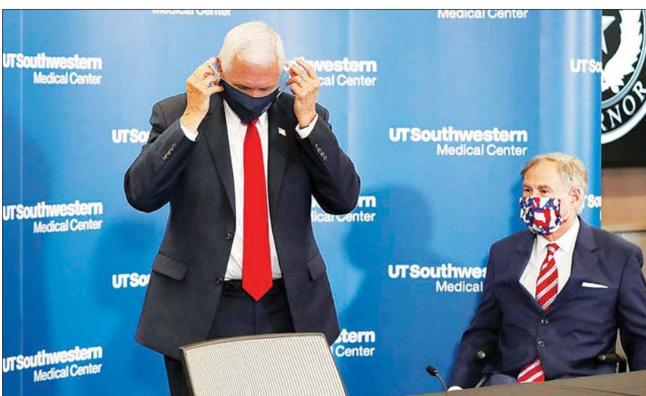
နှာခေါင်းစည်းတပ်ဆင်နေသည့် အမေရိကန် ဒုတိယသမ္မတ မိုက်ပန့်စ်ကို တွေ့ရစဉ်။

ဝါရှင်တန် ဇွန် ၂၉ အမေရိကန်တွင် ကိုဗစ်-၁၉ ကူးစက် ပျံ့နှံ့မှု အရှိန်လျှော့ချနိုင်ရေးအတွက် အမေရိကန်ပြည်သူများ နှာခေါင်းစည်းတပ်ဆင်ကြရန် ဒုတိယ သမ္မတ မိုက်ပန့်စ်က တိုက်တွန်းခဲ့သည်။ ကူးစက်မှုမြင့်သည့် ဒေသများတွင် နှာခေါင်းစည်း တပ်ဆင်ခြင်းနှင့် လူအချင်းချင်း ခပ်ခွာခွာနေခြင်းတို့သည် လုပ်ဆောင်သင့်သည့်အရာများ ဖြစ်ကြောင်း ဇွန် ၂၈ ရက်က တက္ကဆက် ပြည်နယ်တွင်ပြုလုပ်သည့် သတင်းစာ ရှင်းလင်းပွဲ၌ မိုက်ပန့်စ်ကပြောကြား သည်။ မိုက်ပန့်စ် ကိုယ်တိုင်လည်း လေယာဉ်ပေါ်မှဆင်းလာစဉ် ပါးစပ် နှာခေါင်းစည်း တပ်ဆင်လာသည်ကို တွေ့ရသည်။ အမေရိကန်သမ္မတ ဒေါ်နယ် ထရမ်သည် လူထုနှင့်တွေ့ဆုံသည့် အခါမျိုး၌ နှာခေါင်းစည်း တပ်ဆင်သည့်အကြိမ်မှာ ရှားပါး သည်။ တောင်ပိုင်းနှင့် အနောက်ပိုင်း ပြည်နယ်များတွင် နှာခေါင်းစည်း တပ်ဆင်ခြင်းနှင့် ပတ်သက်ပြီး အငြင်း အခုံ ပြုမှုများ မြင့်တက်နေသည်။ အမေရိကန်ပြည်ထောင်စုသည် ကမ္ဘာ ပေါ်တွင် ကိုဗစ် - ၁၉ ကူးစက်မှု