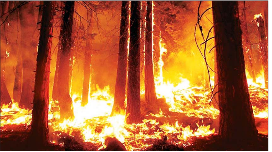
ရုရှားနိုင်ငံတွင်ဖြစ်ပွားသည့် တောမီးလောင်မှုတစ်ခုကို တွေ့ရစဉ်။