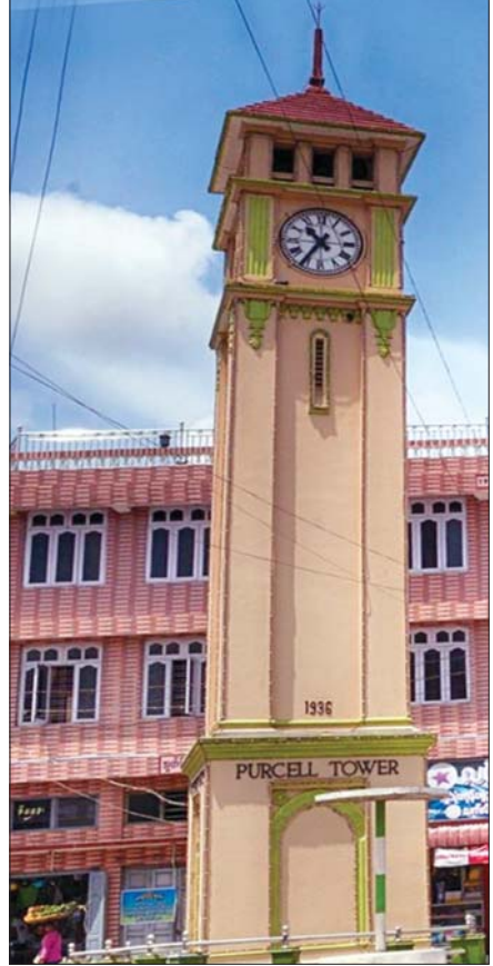
ပါစယ် နာရီစင်

၂၀၁၈ ခုနှစ် မတ်လတွင် ထုတ်ပြန်သည့် စာရင်းများ အရ ခရီးသွားများ လာရောက်လည်ပတ်မှုများပြားသည့် ပြင်ဦးလွင်မြို့တွင် အစိုးရပိုင်ဟိုတယ်သုံးလုံးနှင့် ပုဂ္ဂလိက ပိုင်ဟိုတယ် ၄၈ လုံး ဖွင့်လှစ်ထားကာ စည်ပင်လက်ခံနိုင် သည့် အခန်းပေါင်း ၁၁၃၁ ခန်း ရှိသည်။ ယင်းဟိုတယ်များ အပြင် မိုတယ် ခုနစ်ခု၊ အင်းတစ်ခုနှင့် တည်းခိုခန်း ၁၀၀ ကိုလည်း ဖွင့်လှစ်ထားသဖြင့် ပြင်ဦးလွင်သို့ ရောက်ရှိလာ ကြသည့် ခရီးသည်များသည် နားခိုရန် အခက်အခဲမရှိ ပါချေ။