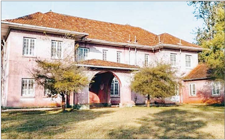
ချယ်ရီမြိုင် အဆောက်အအုံ

မန္တလေးမြို့မှ ၄၂ မိုင်၊ လားရှိုးမြို့မှ ၁၆၇ မိုင်နှင့် မိုးကုတ်မြို့မှ ၈၃ မိုင် ကွာဝေးသည့် ပြင်ဦးလွင်မြို့သည် မန္တလေး-လားရှိုး မီးရထားလမ်းနှင့် မော်တော်ကားလမ်း ပေါ်တွင်တည်ရှိကာ အရှေ့ဘက်နှင့် မြောက်ဘက်တွင် နောင်ချိုမြို့နယ်၊ အနောက်ဘက်တွင် ပုသိမ်ကြီးမြို့နယ် နှင့် မတ္တရာမြို့နယ်၊ တောင်ဘက်တွင် ကျောက်ဆည်မြို့နယ်တို့နှင့် ထိစပ်နေကာ မြန်မာနိုင်ငံနေရာဒေသ အသီးသီးမှ ကား၊ ရထားတို့ဖြင့် အလွယ်တကူသွား ရောက်နိုင်သည်။