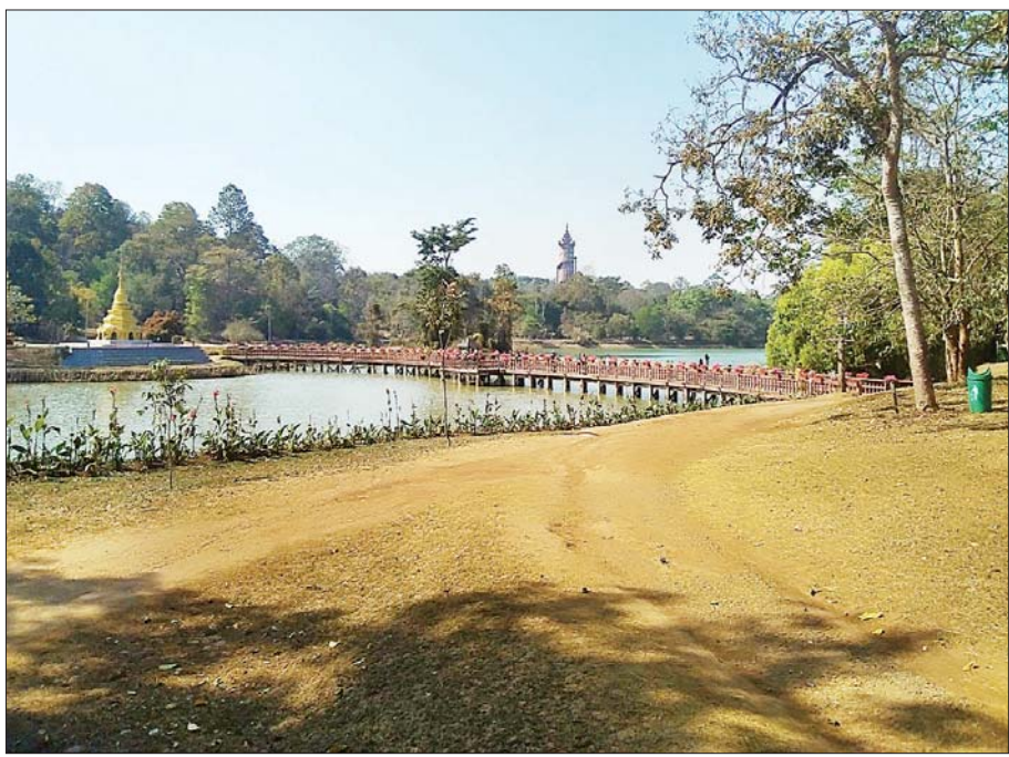
ပြင်ဦးလွင် ရက္ခဗေဒ ဥယျာဉ်

ဧည့်ရိပ်သာအဖြစ် အသုံးပြုလျက်ရှိသည်။ ချယ်ရီမြိုင်မှ ဆက်သွားလျှင် ရဲတိုက်ပုံစံ၊ အနီရောင်နှစ်ထပ် အဆောက်အအုံဖြစ်သည့် ယုဇနမြိုင် (Knowle) ကို မြင်တွေ့နိုင်ကာ ယုဇနမြိုင်ကို ယခင်က တပ်မတော်ဧည့်ဂေဟာအဖြစ် အသုံးပြုခဲ့သည်။ ပြင်ဦးလွင် ခရိုင်သစ်တောဦးစီးဌာနရုံး အဆောက်အအုံကို ၁၉၀၆ ခုနှစ်က တည်ဆောက်ခဲ့ကာ ဟာသံမြိုင်