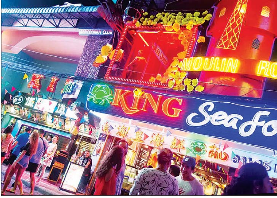
ထိုင်းနိုင်ငံ ဘန်ကောက်မြို့၌ ညဘက်သွားလာလှုပ်ရှားမှုများကို တွေ့ရစဉ်။

ကျန်းမာရေးစနစ်သည် လက်ရှိအခြေအနေကို ကိုင်တွယ် စွမ်းရှိသည်ဟု ယုံကြည်ကြောင်း ထိုင်းဝန်ကြီးချုပ်က ပြောကြားသည်။ ဇူလိုင် ၁ ရက်မှစတင်ကာ အရက်ဘားများ၊ နိုက်ကလပ်များ၊ ကာရာအိုကေခန်းများကို ပြန်ဖွင့်ခွင့်ရမည်ဖြစ်သည်။ သို့သော် အဆိုပါဆိုင်များကို သန့်ဆေးခြင်းအချိန်တွင် ပိတ်ရမည်ဖြစ်ကာ လူအချင်းချင်း ခပ်ခွာခွာနေသည့်စနစ်ကို ကျင့်သုံးရမည်ဟု ကိုဗစ် - ၁၉ အခြေအနေဆိုင်ရာ စီမံခန့်ခွဲမှုစင်တာမှ ပြောရေးဆိုခွင့်ရှိသူ တစ်စင်း ဗီဆာနယိုသင်က ပြောသည်။ အနိပ်ခန်းများနှင့် လက်ဖက်ရည်ဆိုင်များသည် အစိုးရ၏ ခြေရာခံ အက်ပလီကေးရှင်းတွင် လာရောက်သည့် စားသုံးသူများကို မှတ်ပုံတင်ရမည်ဖြစ်သည်။ ဝန်ထမ်းများသည်လည်း မကြာခဏဆိုသလို ကိုဗစ်-၁၉ ဆေးစစ်ခြင်းဆောင်ရွက်ရမည်ဖြစ်သည်။ ထို့အပြင် ထိုင်းနိုင်ငံသို့ ဝင်ရောက်မည့် နိုင်ငံခြားသားများအတွက် ပြည်ဝင်ခွင့်ကန့်သတ်ချက်များကိုလည်း ဖြေလျှော့ပေးသွားမည်ဟု သိရသည်။ အေအက်ပီပီ