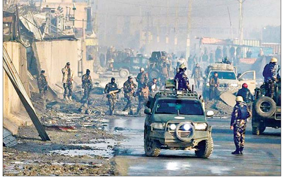
အာဖဂန်ရှိ လက်နက်ကြီးကျရောက်ခဲ့ရာနေရာတွင် လုံခြုံရေးတပ်ဖွဲ့ဝင်များကို တွေ့ရစဉ်။