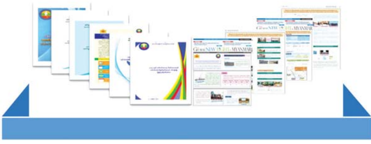
ရခိုင်ပြည်နယ်ဆိုင်ရာအကြံပြုချက်များအပေါ် အကောင်အထည်ဖော်ဆောင်ရွက်ရေးကော်မတီ

ကော်မတီစတင်ဖွဲ့စည်းအကောင်အထည်ဖော်သည့် ၂၀၁၇ ခုနှစ် စက်တင်ဘာလမှ ၂၀၁၉ ခုနှစ် ဒီဇင်ဘာလအထိ လုပ်ငန်းဆောင်ရွက်မှုများကို အစီရင်ခံစာ(၆)ကြိမ်ဖြင့် ပြည်သူများသို့ နိုင်ငံပိုင်သတင်းစာမှတစ်ဆင့် အသိပေးတင်ပြနိုင်ခဲ့ပြီး၊ ယခုအစီရင်ခံစာကာလ ၂၀၂၀ ပြည့်နှစ် ဇန်နဝါရီလမှ ဧပြီလအထိ (၄)လတာကာလအတွင်း လုပ်ငန်းဆောင်ရွက်မှုများကို သတ္တမအကြိမ်မြောက် ပြည်သူသို့ တင်ပြခြင်း ဖြစ်ပါကြောင်းနှင့် ရခိုင်ပြည်နယ်တည်ငြိမ်အေးချမ်းရေးနှင့်ဖွံ့ဖြိုးတိုးတက်ရေးအတွက်ကဏ္ဍပေါင်းစုံမှ ဆက်လက်ကြိုးပမ်းအကောင်အထည်ဖော်ဆောင်ရွက်လျက်ရှိကြောင်း လေးစားစွာဖော်ပြအပ်ပါသည်။