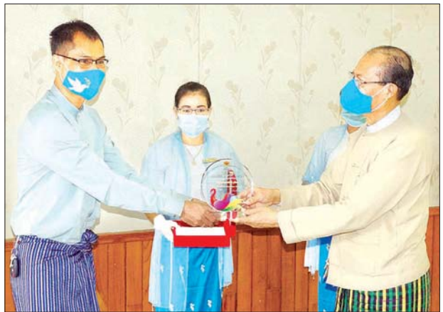
ရှေးဦးစွာ နေပြည်တော်ကောင်စီ ဥက္ကဋ္ဌ ဒေါက်တာမျိုးအောင်က နိုင်ငံတော်အစိုးရအနေဖြင့် Corona-virus Disease Covid-19 ကာကွယ်၊ ထိန်းချုပ်၊ ကုသရေး အမျိုးသားအဆင့်

ကိုဗစ်-၁၉ ကာကွယ်၊ ထိန်းချုပ်ရေး အိမ်တွင်းဖြစ် ပိတ်စနာခေါင်းစည်း (Mask) ချုပ်လုပ်မှုပြိုင်ပွဲတွင် တီထွင်ဖန်တီးမှုအကောင်းဆုံး ဒုတိယဆုရရှိသူအား နိုင်ငံတော်၏အတိုင်ပင်ခံပုဂ္ဂိုလ်က ချီးမြှင့်သည့် ဂုဏ်ပြုဆုတံဆိပ်နှင့် ဂုဏ်ပြုမှတ်တမ်းလွှာပေးအပ်ခြင်းနှင့် Quarantine Center များတွင် စွမ်းစွမ်းတစ်ပါဝင်ကူညီခဲ့ကြသည့် စေတနာ့ဝန်ထမ်းအဖွဲ့အစည်းများအား ဂုဏ်ပြုမှတ်တမ်းလွှာပေးအပ်ခြင်းအခမ်းအနားကို ယနေ့ နံနက် ၁၀ နာရီတွင် နေပြည်တော်ကောင်စီရုံး အစည်းအဝေးခန်းမ၌ ကျင်းပသည်။