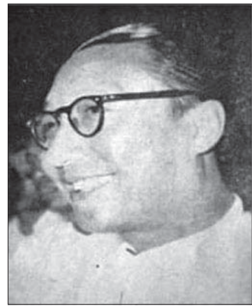
ဒါရိုက်တာ ရွှေခုံးဘီအောင်

ကြည်စိုးထွန်း ။ ။ ဟားဟားဟား။ မောင်မောင်တာ ။ ။ ပြောသွားတာ ပေါ့ လေ။ ရယ်စရာလိုလို နဲ့ အဲဒီနှစ်မှာ ကိုထွန်းဝေက မင်းသား ဖြစ်သွားပြီးတော့ ဗိုလ်မြဒင်နဲ့ သူက အကယ်ဒမီ ယူသွားတယ်။ မောင်မောင်တာ ။ ။ လုပ်လိုက်ပါ ကွာတဲ့ မင်းက လည်း ကျွန်တော့်ကို နှစ်သိမ့်တဲ့စကားတွေ ပြောစစ ချင်းကတော့ မြင်းချိုတပ်ပေးလို့ မရဘူး ပြောတယ်။ နှစ်သိမ့်တဲ့စကား ပြောပြီးတော့ ကျေနပ်လိုက်ပါတယ် ကျွန်တော်။ ဒါပေမယ့် မရတဲ့အကြောင်းတွေ ကြုံတုန်းကြုံတုန်းမှာ ဖော်ရတာပေါ့။ နာတယ်လို့တော့ ထင်တယ်။ ကျွန်တော် တန်ဖိုးထားလို့ပါ ဒါလည်း။ ကြည်စိုးထွန်း ။ ။ မှန်ပါတယ်။ အစ်ကို မှန်ပါတယ်။ တစ်ခါ