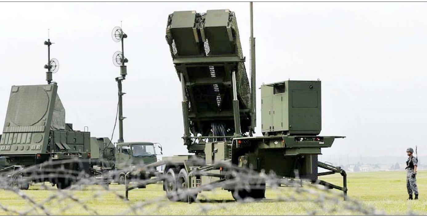
အမေရိကန်ခွဲခွင်းစနစ်များကို တွေ့ရစဉ်။

ကာကွယ်ရေးဝန်ကြီး တာရိုကိုနိုက ဂျပန်ဟာ နိုင်ငံ လုံခြုံရေးကို အဆက်မပြတ် ခြိမ်းခြောက်လာတဲ့ ဒေသတွင်းခြိမ်းခြောက်မှုတွေကို ရင်ဆိုင်တဲ့နေရာမှာ ကာကွယ်ရေးဆိုင်ရာတည်ရှိမှုအနေအထားတစ်ရပ်လုံးကို စွမ်းရည်မြှင့်တင်ဖို့ လုပ်ဆောင်ရလိမ့်မယ်။ ခွဲခွင်းစနစ်ချ ထားမယ့် အစီအစဉ်တစ်ခုတည်းနဲ့ ရှေ့ကိုတက်လှမ်းဖို့ မဖြစ်နိုင်သေးတဲ့အပြင် မြောက်ကိုရီးယားနိုင်ငံရဲ့ ခြိမ်းခြောက်မှုအန္တရာယ်တွေကလည်း ရှိနေသေးတယ် လို့ ပြီးခဲ့တဲ့ရက်သတ္တပတ်အတွင်း တိုကျိုမှာပြုလုပ်တဲ့ ရှင်းလင်းပွဲတစ်ခုမှာ အလေးအနက်ပြောကြားခဲ့ပါတယ်။