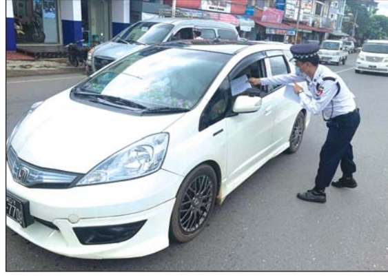
ယာဉ်မောင်းသူတစ်ဦးအား ဥပဒေစာအုပ် ဝေငှပေးနေစဉ်

မော်လမြိုင် ဇွန် ၂၉ မွန်ပြည်နယ် မော်လမြိုင်မြို့၌ ယာဉ်အန္တရာယ်ကင်းရှင်းရေးအတွက် ပြည်သူများ အား ၂၀၂၀ ပြည့်နှစ် မော်တော်ယာဉ်စီမံခန့်ခွဲမှုဥပဒေအကြောင်း ရှင်းလင်းပြီး ဥပဒေစာအုပ်များ ဝေငှပေးခြင်းကို အမှတ် (၁၂) ယာဉ်ထိန်းရဲဘဲလ်ဖွဲ့ခွဲ၊ အမှတ် (၇၇) ယာဉ်ထိန်းရဲဘဲလ်ဖွဲ့ (မော်လမြိုင်)မှ ရဲအုပ် သက်ဆောင်ကျော်နှင့် တပ်ဖွဲ့ဝင် ၃၀ က ဇွန် ၂၈ ရက်တွင် မော်လမြိုင်ဈေးကြီး မီးပွိုင့်၌ ဆောင်ရွက်ခဲ့ သည်။ ဖြတ်သန်းသွားလာသည့် မော်တော်ယာဉ်နှင့် မော်တော်ဆိုင်ကယ်များအား ရပ်တန့်စေ၍ ယာဉ်မောင်းသူများအား ၂၀၂၀ ပြည့်နှစ် မော်တော်ယာဉ်စီမံခန့်ခွဲမှု ဥပဒေပါအကြောင်းအရာများကိုလည်းကောင်း၊ မော်တော်ဆိုင်ကယ်များအနေဖြင့် နေ့တွင်ဖြစ်စေ၊ ညဘက်တွင်ဖြစ်စေ အရှေ့ အောက်မီးဖွင့်၍ မောင်းနှင်ရန် လည်းကောင်း အသိပညာပေးပြောကြားပြီး ယာဉ်စည်းကမ်း လမ်းစည်းကမ်း ပညာပေး လက်ကမ်းစာစောင်များကို ဝေငှပေးခဲ့ကြောင်း သိရသည်။ ကိုကိုရူပ