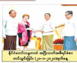
နိုင်ငံတော်သမ္မတထံ အပြီးသတ်အစီရင်ခံစာ တင်သွင်းခြင်း (၂၀-၁-၂၀၂၀)ရက်နေ့

ရခိုင်ပြည်နယ်ဆိုင်ရာ အကြံပြုချက်များအပေါ် အကောင်အထည်ဖော် ဆောင်ရွက်ရေးကော်မတီ၏ အကြံပေးအဖွဲ့သည် ရခိုင်ပြည်နယ်တွင် လူ့အခွင့်အရေးချိုးဖောက်မှုများအား စုံစမ်းစစ်ဆေးရန် နိုင်ငံတကာအဖွဲ့ဝင်များ ပါဝင်သည့် "လွတ်လပ်သောအချက်အလက်ရှာဖွေရေးကော်မရှင်တစ်ရပ်" အား ဖွဲ့စည်းရန် ကြားဖြတ်အကြံပြုချက်များတွင် အကြံပြုခဲ့ပါသည်။ ပြည်ထောင်စုသမ္မတ မြန်မာနိုင်ငံတော်အစိုးရသည် ၂၀၁၇ ခုနှစ်၊ ဩဂုတ်လ (၂၅) ရက်နေ့နှင့် ယင်းကာလ နောက်ပိုင်းတွင် ဖြစ်ပွားခဲ့သည့်တိုက်ခိုက်မှုများနှင့် ဒေသခံအခြောက်အမြားအားနေရပ်စွန့်ခွာသွားစေသည့် ယင်းတိုက်ခိုက်မှုများ၏ နောက်ဆက်တွဲကိစ္စရပ်များကို စုံစမ်းစစ်ဆေးရန်၊ ယင်းပဋိပက္ခဖြစ်စဉ်များနှင့် ဆက်စပ်သည့် တာဝန်ရှိသူများကို ဖော်ထုတ်နိုင်ရန်နှင့် ရခိုင်ပြည်နယ် ရေရှည်တည်ငြိမ်အေးချမ်းရေးနှင့် ဖွံ့ဖြိုးတိုးတက်ရေးနှင့်စပ်လျဉ်း၍ မည်သည့်လုပ်ငန်းစဉ်များကို ချမှတ်ဆောင်ရွက်သင့်သည်ဟူသည့်အကြံပြုချက်များကိုပေးစွမ်းနိုင်ရန်ရည်ရွယ်၍ (၃၀-၇-၂၀၁၈) ရက်နေ့တွင် အဖွဲ့ဝင်(၄)ဦးပါသော လွတ်လပ်သော စုံစမ်းစစ်ဆေးရေးကော်မရှင် (ICOE) ကို ဖွဲ့စည်းခဲ့ပါသည်။ ကော်မရှင်က အပြီးသတ်အစီရင်ခံစာကို နိုင်ငံတော်သမ္မတထံ(၂၀-၁-၂၀၂၀) ရက်နေ့တွင် တင်သွင်းခဲ့ပါသည်။