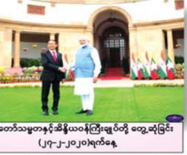
နိုင်ငံတော်သမ္မတနှင့်အိန္ဒိယဝန်ကြီးချုပ်တို့ တွေ့ဆုံခြင်း (၂၇-၂-၂၀၂၀)ရက်နေ့

ပြည်ထောင်စုသမ္မတမြန်မာနိုင်ငံတော်၊ နိုင်ငံတော်သမ္မတ ဦးဝင်းမြင့်သည် (၂၇-၂-၂၀၂၀)ရက်နေ့မှ (၂၉-၂-၂၀၂၀)ရက်နေ့အထိ အိန္ဒိယသမ္မတနိုင်ငံသို့ ချစ်ကြည်ရေးခရီးစဉ်အတွင်း အိန္ဒိယ ဝန်ကြီးချုပ်မဟာရှာဒါကာရင်ဒရာမိုဒီနှင့်တွေ့ဆုံစဉ် ရခိုင်ပြည်နယ် အရေးကိစ္စနှင့်စပ်လျဉ်း၍ ထည့်သွင်းဆွေးနွေးခဲ့ပြီး၊ ခရီးစဉ်ဆိုင်ရာ မြန်မာ-အိန္ဒိယပူးတွဲကြေညာချက်တွင် ရခိုင်ပြည်နယ်၌ လူမှုစီးပွားရေးဖွံ့ဖြိုးတိုးတက်စေရန်အတွက် အိန္ဒိယဘက်မှ ဆက်လက်ကူညီပံ့ပိုးသွားမည်ဖြစ်ကြောင်း ဖော်ပြထားပါသည်။