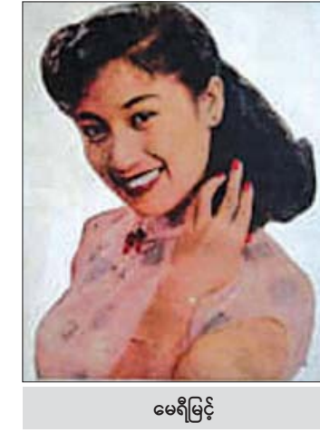
မေရီမြင့်