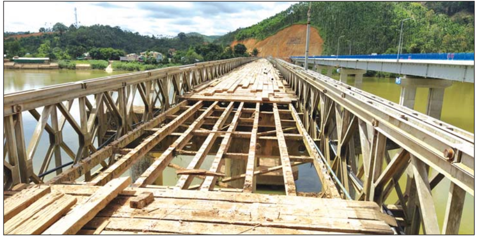
တံတားဟောင်းမှ ဘောလီနှင့် ဆက်စပ်ပစ္စည်းများကို ပြန်လည်ဖြုတ်သိမ်းနေစဉ် အရှည် ပေ ၁၀၀ နှင့်အောက် ကျေးရွာချင်းဆက် တံတား တံတား တည်ဆောက်ရေးအဖွဲ့(၄)မှ သိရသည်။ ငယ်များတွင် ပြန်လည်အသုံးပြုသွားမည် ဖြစ်ကြောင်း သတင်းနှင့်စာတို-နန်းသာရီ-ထိန်ဝင်း(ပြန်/ဆက်)

တန်သာ ဖြတ်သန်းခွင့်ပြုသည့် တစ်လမ်းမောင်း တံတား ဖြစ်သည်။ အဆိုပါတံတားဟောင်းသည် သက်တမ်း ၂၁ နှစ် ကြာမြင့်နေပြီဖြစ်ရာ သဘာဝရာသီဥတုဒဏ်များနှင့် နေစဉ် ဖြတ်သန်းသွားလာနေသည့် ကုန်တင်ယာဉ်များ၏ ဒဏ်ကြောင့် ဟောင်းနွမ်းဆွေးမြည့်လာသလို တနင်္သာရီတံတား သစ်ကြီးမှာလည်း တည်ဆောက်ပြီးစီးကာ ဇွန် ၁၃ ရက်မှ စ၍ မော်တော်ယာဉ်များကို တံတားသစ်ပေါ်မှ ဖြတ်သန်း သွားလာခွင့်ပြုထားပြီဖြစ်သဖြင့် လမ်းပန်းဆက်သွယ်မှု၊ ကုန်စည်စီးဆင်းမှုများ အဆင်ပြေချောမွေ့နေပြီဖြစ်သော ကြောင့် တံတားဟောင်းမှ ဘောလီနှင့် ဆက်စပ်ပစ္စည်းများကို ပြန်လည်ဖြုတ်သိမ်းနေခြင်းဖြစ်ကြောင်း သိရသည်။ တံတားဟောင်းကို ဖြုတ်သိမ်းသည့် လုပ်ငန်းသည် အနည်းဆုံး ၁၅ ရက်ခန့် ကြာမြင့်မည်ဖြစ်ကြောင်းနှင့် အဆိုပါ တံတားဟောင်းကို ဖြုတ်သိမ်းမှုမှ ပြန်လည်ရရှိသော ဘောလီနှင့် ဆက်စပ်ပစ္စည်းများကို တနင်္သာရီမြို့နယ်အတွင်း ကျေးလက်လမ်းဖွံ့ဖြိုးရေးဦးစီးဌာနက တည်ဆောက်မည့်