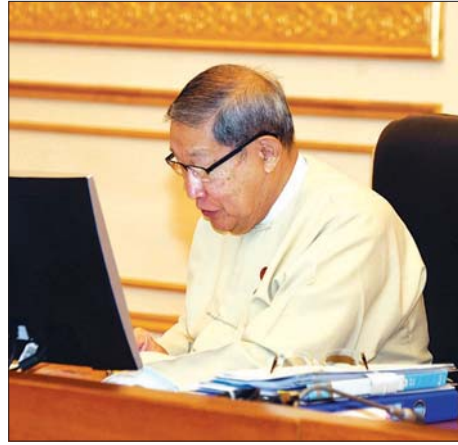
ပြည်ထောင်စုဝန်ကြီး ဦးစိုးဝင်း

ပြည်သူ့ဘဏ္ဍာငွေများကို သုံးစွဲရာတွင် ပြည်သူကို တိုက်ရိုက်အကျိုးပြုသည့် အသုံးစရိတ်များကို ပထမ ဦးစားပေး သုံးစွဲရမည်ဖြစ်ပြီး ရုံးဌာနများအတွက် အသုံး စရိတ်များကို ဒုတိယဦးစားပေးသော ထားရမည်ဖြစ်ပါ ကြောင်း၊ ပြည်ထောင်စုဝန်ကြီးဌာနတိုင်း အုပ်ချုပ်မှု အသုံးစရိတ်များကို တတ်နိုင်သမျှလျော့ချပြီး နိုင်ငံစီးပွား