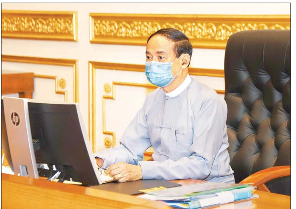
နိုင်ငံတော်သမ္မတ ဦးဝင်းမြင့် ဘဏ္ဍာရေးကော်မရှင် (၂/၂၀၂၀) ကြိမ်မြောက် အစည်းအဝေးသို့ တက်ရောက် လမ်းညွှန်အမှာစကားပြောကြားစဉ်။

နိုင်ငံတော်နှင့် ပြည်သူ့အတွက် ကဏ္ဍအလိုက် ငွေလုံး ငွေရင်းလုပ်ငန်းများ ဆောင်ရွက်ရာတွင် ပြည်ထောင်စု ဘဏ္ဍာရန်ပုံငွေဖြင့် ဆောင်ရွက်ခြင်းနှင့် တိုင်းဒေသကြီး/ ပြည်နယ်ဘဏ္ဍာရန်ပုံငွေဖြင့် ဆောင်ရွက်ခြင်းတို့ မထပ်စေ ရေး စိစစ်ကြရန် လိုပါကြောင်း၊ ပြည်ထောင်စုဝန်ကြီးဌာန အချင်းချင်း ညှိနှိုင်းမှု၊ ပြည်ထောင်စုဝန်ကြီးဌာနနှင့်