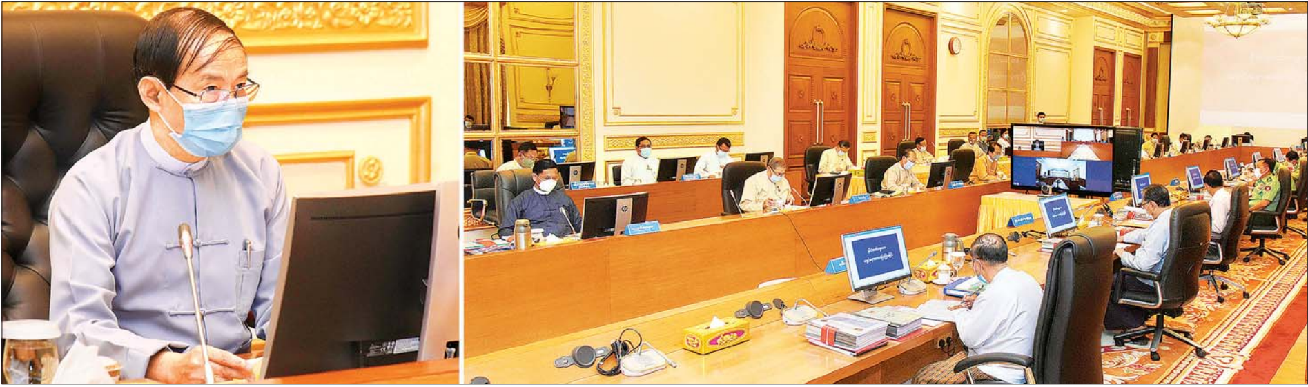
အမျိုးသားစီမံကိန်းကော်မရှင် (၁/၂၀၂၀) အစည်းအဝေး ကျင်းပစဉ်။