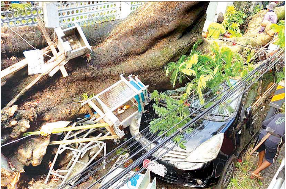
ဇွန် ၂၂ ရက် နံနက် ၃ နာရီခန့်က စမ်းချောင်းမြို့နယ် လင်းလွန်းမြောက်ရပ်ကွက် ၉ လွန်လမ်းအတွင်းရှိ အမြင့်ပေ ၆၀ ခန့် လုံးပတ်ရစ်ပေခန့်ရှိ စိန်ပန်းပင်ကြီး ရုတ်တရက်လဲပြိုမှုဖြစ်ခဲ့ရာ စမ်းချောင်းမြို့နယ် မီးသတ်တပ်ဖွဲ့မှ အုပ်ချုပ်မှုဦးစီးဌာနမှ အဖွဲ့ဝင်များက လာရောက်အကူအညီပေးကြသည်။ (စိန်ပန်းပင်ပြိုလဲမှုကြောင့် သစ်ပင်အနီးတွင် ညအိပ်ရပ်နားထားသော မော်တော်ယာဉ်လေးစီး၊ သစ်ပင်အနီးမှ ခြောက်ထပ်တိုက်လေးလွှာနှစ်ခန်းတွဲပျက်စီးခဲ့ပြီး အနီးဝန်းကျင်ရှိ လူများထိခိုက်မှုမရှိကြောင်း သိရသည်။) ကိုကြီးတင်