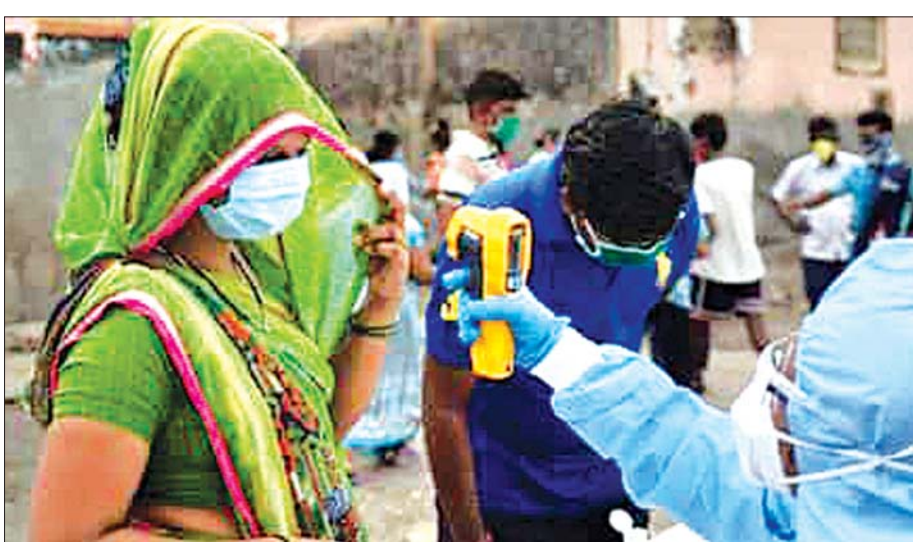
အပူချိန်တိုင်းတာစစ်ဆေးမှုခံယူနေသည့် အိန္ဒိယအမျိုးသမီးတစ်ဦးကို တွေ့ရစဉ်။

ဒါပေမယ့် အမျိုးသားတွေဟာ ကျန်းမာရေးဆိုင်ရာ ပြဿနာတွေ ဥပမာ - နှလုံးသွေးကြောဆိုင်ရာ ရောဂါတွေနဲ့ သွေးတိုးရောဂါတွေမှာလည်း ပိုမိုအမြစ်များတတ်ကြတယ်