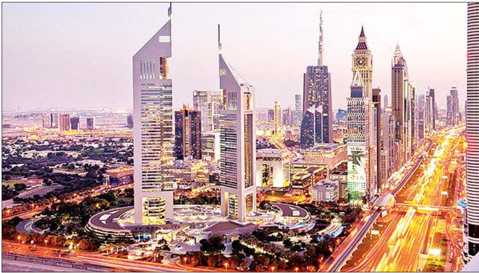
ဒူဘိုင်းမြို့ကို အပေါ်စီးမှတွေ့မြင်ရစဉ်။

ဒူဘိုင်းသည် ယူအေအီးနိုင်ငံ၏ စီးပွားရေးအချက်အချာကျသည့် နေရာလည်း ဖြစ်သည်။ ကိုဗစ်-၁၉ ပျံ့နှံ့မှု ထိန်းချုပ်ရေးအတွက် မတ်လ အလယ်မှစတင်ကာ နိုင်ငံခြားခရီးသွားများဝင်ရောက်ခွင့်ကို ပိတ်ပင်ထားခဲ့သည်။ ထွက်ခွာသည့်ကိစ္စတွင် ပီစီအာ စမ်းသပ်မှုပြုလုပ်ရမည်ဖြစ်ပြီး စမ်းသပ်မှုရလဒ်တွင် ရောဂါမရှိဟု ပြသမှသာ ဝင်ရောက်ခွင့်ရမည် ဖြစ်သည်။ နောက်ထပ်လိုအပ်ချက် တစ်ခုမှာ ဒူဘိုင်းတွင် ဆေးကုသ စရိတ်အတွက် ကာမိသည့် ကျန်းမာရေး အာမခံရှိရမည်ဖြစ်သည်။ ဒူဘိုင်း လေဆိပ်သို့ ရောက်သည့်အခါတွင် လည်း ဆေးစစ်မှုခံယူရန်လိုအပ်ပြီး