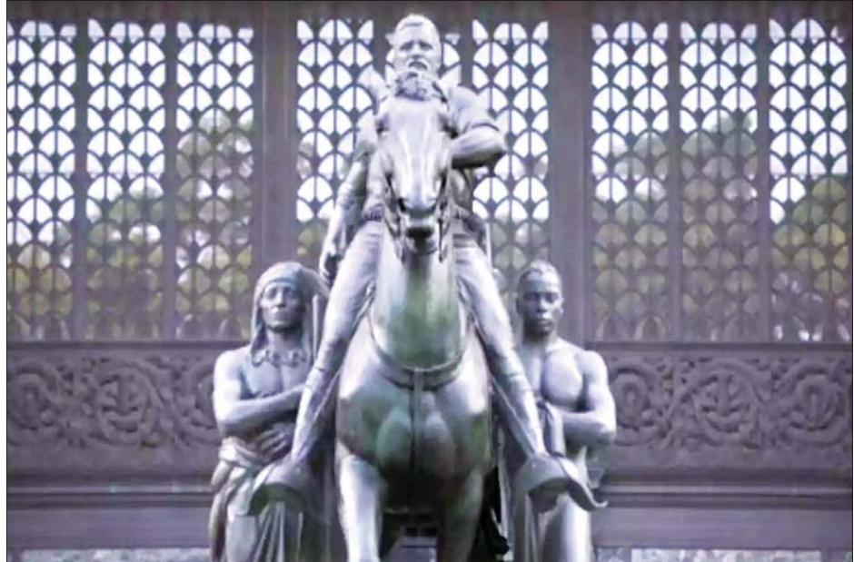
သဘာဝသမိုင်းပြတိုက်ဝင်ပေါက်ရှေ့မှ ရုစပဲ၏ရုပ်တုကို တွေ့ရစဉ်။

နယူးယောက်မြို့အာဏာပိုင်များကလည်း ပြတိုက်မှတာဝန်ရှိသူများ၏ ရုပ်တုဖယ်ရှားပေးရေး တောင်းဆိုချက်ကို လိုက်လျော့ပေးရန် သဘောတူခဲ့ကြသည်။ ရုစပဲသည် ၂၀ ရာစုအတွင်း အမေရိကန်၏ ၂၆ ယောက်မြောက်သမ္မတ ဖြစ်ခဲ့သည်။ ရုစပဲ၏ မိသားစုကလည်း ရုပ်တုဖယ်ရှားရေးကိုလက်ခံကြောင်း ကြေညာချက်ထုတ်ပြန်ခဲ့သည်။ အမေရိကန် သမ္မတထရုမ့်ကမူ ရုပ်တု ဖယ်ရှားပစ်ရန် ဆုံးဖြတ်ချက်ကိုဝေဖန်ခဲ့ပြီး အမိပွားမရှိသည့်လုပ်ရပ်ဟု ပြောကြားခဲ့သည်။ အေအက်ဖ်ပီ