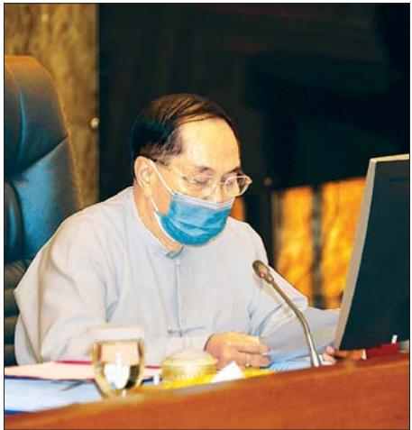
ဒုတိယသမ္မတ ဦးမြင့်ဆွေ

အခွန်ဝေစုအနေဖြင့်လည်း ယခင်နှစ်ကထက် ငွေကျပ် ၁၆ ဘီလီယံ ပိုမိုထောက်ပံ့ပေး ငွေကျပ် ၃၆၉ ဘီလီယံကို