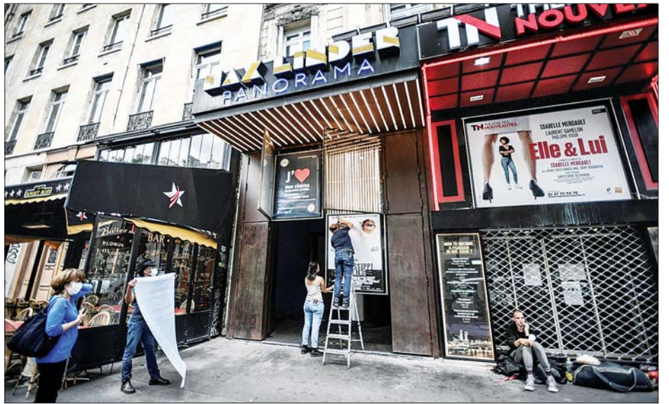
ပါရီမြို့ရှိ ရုပ်ရှင်ရုံတစ်ရုံရှေ့တွင် ပိုစတာများဖယ်ရှားနေသည့် ဝန်ထမ်းများကို တွေ့ရစဉ်။

ရုပ်ရှင်ရုံဝန်ထမ်းများသည်လည်း ပါးစပ်နှာခေါင်းစည်း တပ်ဆင်ကာကြည့်ရမည်ဖြစ်သည်။ အသက် ၄၀ အရွယ် အမျိုးသမီးတစ်ဦးက ရုပ်ရှင်ပြန်ကြည့်ရန်အတွက် သုံးလကြာ စောင့်ဆိုင်းခဲ့ရသည်ဟု ပြောကြားခဲ့သည်။ အားကစားခန်းမများနှင့် ပြိုင်ကွင်းများကို ဇူလိုင် ၁၄ ရက်မှစတင်ကာ ဖွင့်ခွင့်ပေးမည်ဟု သိရသည်။ သို့သော် ပွဲကြည့်ပရိသတ်အရေအတွက်ကိုမူ လျှော့ချရမည်ဟု အင်န်အိတ်ချ်ကေ