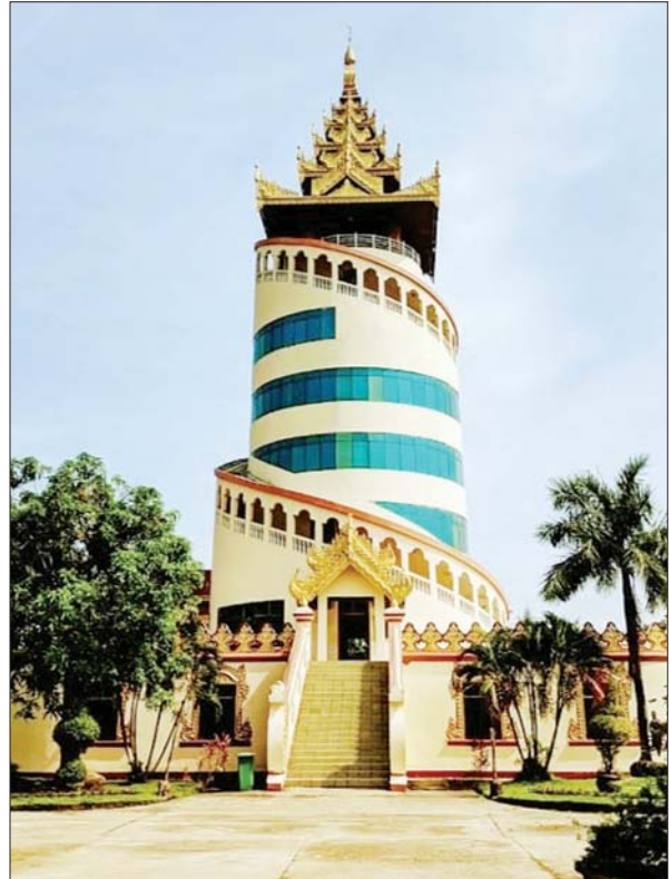
ပြည်ထောင်စု တိုင်းရင်းသားကျေးရွာ

ပုဇွန်တောင်မြို့နယ်နှင့် ဒေါပုံမြို့နယ်ကို ဆက်သွယ် သည့် သာကေတတံတားသည် သက်တမ်း နှစ် ၅၀ ကျော် ချိန်တွင် ကြိုဆိုမှုလျော့နည်းလာသဖြင့် ဂျပန်နိုင်ငံ၏ အကူအညီဖြင့် သာကေတတံတားနှင့် ဘေးချင်းယှဉ် လျက် ဒေါပုံတံတားအသစ်ကို တည်ဆောက်ခဲ့ပြီး ၂၀၁၈ ခုနှစ် ဩဂုတ်လ ၂၅ ရက်နေ့တွင် ဖွင့်လှစ်ခဲ့သည်။