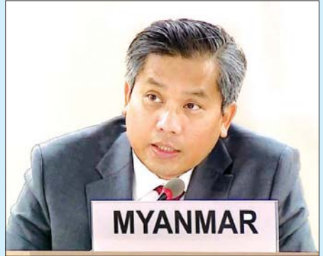
မြန်မာအမြဲတမ်းကိုယ်စားလှယ် ဦးကျော်မိုးထွန်း

ယင်းတို့မှာ နိုင်ငံတစ်နိုင်ငံအပေါ် ဦးတည်ချမှတ်သည့် ဆုံးဖြတ်ချက်များ (country-specific resolutions) ချမှတ်ဆောင်ရွက်ခြင်းကို ရှောင်ရှားရမည်ဖြစ်ကြောင်း၊ လူ့အခွင့်အရေးပြဿနာများကို ကိုင်တွယ်ဖြေရှင်းရာ၌ အပြုသဘောဆောင်ရေး၊ ထိပ်တိုက်မတွေ့ဆုံရေး၊ နိုင်ငံရေးသွတ်သွင်းမှုမရှိရေး၊ ဘက်လိုက်မှုမရှိရေး၊ တရားမျှတစွာ ဆွေးနွေးရေးနှင့် တရားမျှတပြီး တန်းတူညီမျှ ရှိရေးတို့အပေါ် အခြေခံရမည်ဖြစ်ကြောင်း၊ နိုင်ငံတစ်နိုင်ငံအပေါ် ဦးတည်သတ်မှတ်သည့် လုပ်ပိုင်ခွင့်အာဏာများ (country-specific mandates) သည် မြေပြင်အခြေအနေတိုးတက်ကောင်းမွန်လာရေးကို အားပေးရာမရောက်ဘဲ ပိုမိုဆိုးရွားစေမည်သာဖြစ်ကြောင်း၊ ကုလသမဂ္ဂ၏ ရှားပါးသော အရင်းအမြစ်များကို အချည်းနှီး အသုံးမပြုသင့်ကြောင်း၊ ဇွန်လတွင် ကျင်းပမည့် လူ့အခွင့်အရေး