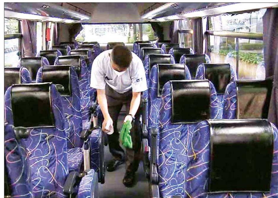
ခရီးသွားကုမ္ပဏီဝန်ထမ်းတစ်ဦးက ဘတ်စ်ကားပေါ်တွင် လေကောင်းလေသန့်ရစေရန် ပြင်ဆင်နေစဉ်။

ဟိုတယ်များနှင့် ရှုခင်းသာ အပန်းဖြေခရီးသွားလာရေးကုမ္ပဏီ များအနေဖြင့် ပျောက်ကွယ်နေသည့် ခရီးသွားများကို ဝမ်းမြောက်ဝမ်းသာ ပြန်လည်မြင်တွေ့ရပြီ ဖြစ်သော် လည်း ရောဂါကာကွယ်ရေးဆိုင်ရာ ဆောင်ရွက်ချက်များ တင်းတင်းကျပ်