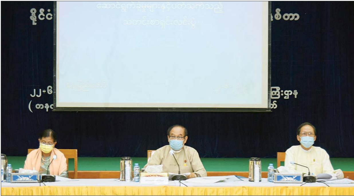
ပြည်ထောင်စုဝန်ကြီး ဒေါက်တာမြင့်ထွေး ကျန်းမာရေးနှင့်အားကစားဝန်ကြီးဌာန၏ ပြည်သူ့အတွက် စတုတ္ထ (၁) နှစ်တာကာလအတွင်း ဆောင်ရွက်ခဲ့မှုများနှင့်စပ်လျဉ်း၍ ရှင်းလင်းပြောကြားစဉ်။

နေပြည်တော် ဇွန် ၂၂ ပြည်သူ့အတွက် စတုတ္ထ (၁) နှစ်တာကာလအတွင်း ဆောင်ရွက်ခဲ့မှုများနှင့် ပတ်သက်သည့် ကျန်းမာရေးနှင့်အားကစားဝန်ကြီးဌာန၊ ပြည်ထောင်စုဝန်ကြီးဌာန နှင့် ကာကွယ်ရေးဝန်ကြီးဌာနတို့၏ သတင်းစာရှင်းလင်းပွဲကို ယနေ့မနက် ၁၀ နာရီက နေပြည်တော်ရှိ ပြန်ကြားရေးဝန်ကြီးဌာန အစည်းအဝေးခန်းမ၌ ကျင်းပသည်။ သတင်းစာရှင်းလင်းပွဲ၌ ကျန်းမာရေးနှင့် အားကစားဝန်ကြီးဌာန၏ ပြည်သူ့အတွက် စတုတ္ထ (၁) နှစ်တာ ကာလအတွင်း ဆောင်ရွက်ခဲ့မှုနှင့်စပ်လျဉ်း၍ ပြည်ထောင်စုဝန်ကြီး ဒေါက်တာမြင့်ထွေး က ရှင်းလင်းပြောကြားသည်။ ထို့နောက် သတင်းမီဒီယာများက မြန်မာနိုင်ငံတွင် ကိုဗစ်-၁၉ ဒုတိယလှိုင်း မကူးစက်ရေးအတွက် ဝန်ကြီးဌာနအနေဖြင့် ကြိုတင်ပြင်ဆင်ဆောင်ရွက်ထားမှုနှင့် စပ်လျဉ်း၍ မေးမြန်းရာ ပြည်ထောင်စုဝန်ကြီး ဒေါက်တာမြင့်ထွေး က ကိုဗစ်-၁၉ ဒုတိယလှိုင်းအတွက် အထွေထွေပြင်ဆင်ရန် မလိုအပ်ပါကြောင်း၊ ယခုပုံစံအတိုင်း လူတိုင်းသည် ကျန်းမာရေးနှင့် အားကစားဝန်ကြီးဌာနမှ ထုတ်ပြန်ထားသည့် ဆောင်ရန်၊ ရှောင်ရန်များကို တိတိကျကျ လိုက်နာ ဆောင်ရွက်ပါက ကိုဗစ်-၁၉ ဒုတိယလှိုင်းအတွက် စိုးရိမ်စရာ မလိုပါကြောင်း၊ ကပ်ရောဂါ သဘောသဘာဝအရ ရောဂါကူးစက်မှုမှာ အတက်၊ တည့်တည့်သွား၊ ပြန်ကျ ဖြစ်ပါကြောင်း၊ အခုအခြေအနေတွင် မတက်တော့ဘဲ နည်းနည်း ပြန်ဆင်းနေသည့် ပုံစံဖြစ်ပါကြောင်း၊ ပြည်သူများအနေဖြင့် မလိုအပ်သလို ပါကြောင်း၊ Mask တပ်ဆင်ခြင်းသည် ရောဂါကာကွယ်ရေးအတွက် အရေးကြီးသည့်အတွက် စာမျက်နှာ ၉ ကော်လံ ၁ ◯