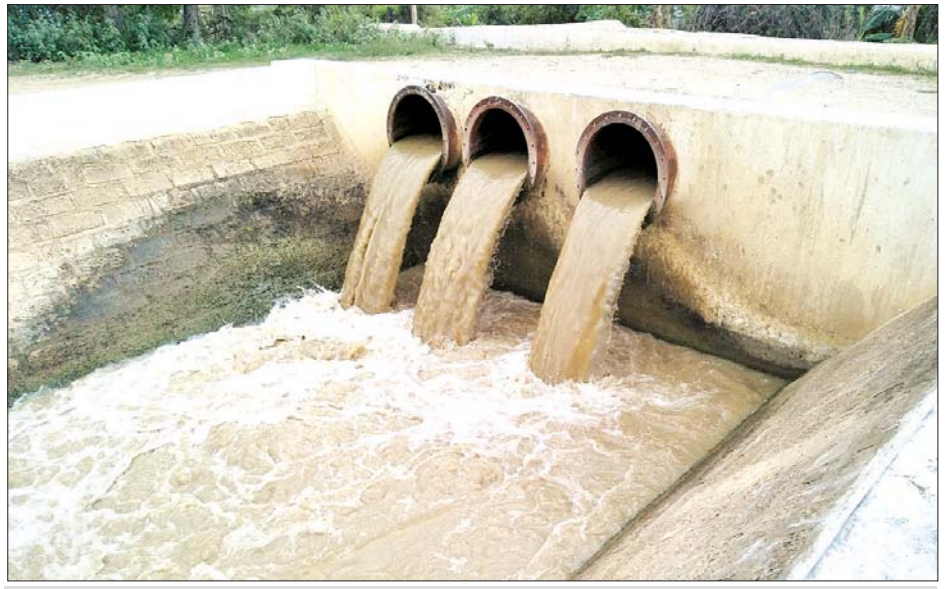
မင်းရွာမြစ်ရေတင်စီမံခန့်ခွဲရေး စိုက်ပျိုးရေးပေးဝေနေမှုကို တွေ့ရစဉ်။

ဒေသကြီး ဒုတိယ ညွှန်ကြားရေးမှူး ဦးသန်းချိုတို့နှင့် တာဝန်ရှိသူများ၊ မင်းရွာလှုပ်စစ်မြစ်ရေတင်ရေသောက် စိုက် ကေများမှ ကျေးရွာသူ ကျေးရွာ သားများ တက်ရောက်ကြသည်။ ပခုက္ကူခရိုင်အတွင်း၌ မြစ်ရေတင် ၁၄ ခုရှိရာ မြစ်ရေတင်ခြောက်ခုတွင် WUG/WUA အဖွဲ့ ၃၆ ဖွဲ့ ဖွဲ့စည်းပြီး ဖြစ်ကာ ခုနစ်ခုမြောက်ဖြစ်သော မင်းရွာကျေးရွာအတွက် ယနေ့ အစည်းအဝေး ကျင်းပခြင်းဖြစ်ပြီး ပခုက္ကူခရိုင်တစ်ခုလုံးအတွင်း၌ WUG/ WUA အဖွဲ့ပေါင်း ၁၄၀ ဖွဲ့စည်းမည် ဖြစ်သည်။ အိမ်နီးဆွေ(ရေစကြို)