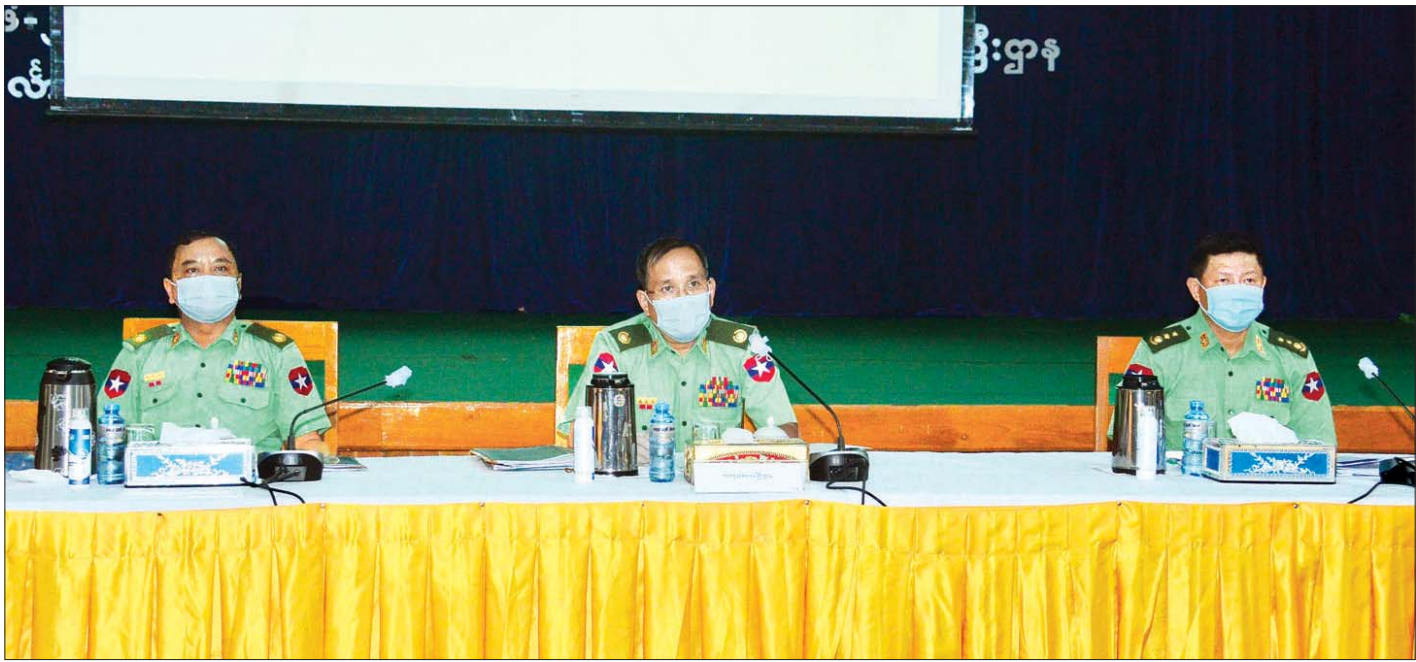
ကာကွယ်ရေးဝန်ကြီးဌာန၏ ပြည်သူ့အတွက် စတုတ္ထ (၁) နှစ်တာကာလအတွင်း ဆောင်ရွက်ခဲ့မှုများနှင့် စပ်လျဉ်း၍ အမြဲတမ်းအတွင်းဝန် ဗိုလ်မှူးချုပ် အောင်ကျော်ဟိုးက ရှင်းလင်း ပြောကြားစဉ်။

ထို့နောက် သတင်းမီဒီယာများက မြန်မာနိုင်ငံ ရဲ့တပ်ဖွဲ့ဝင်များကို ပြောင်းရွှေ့နေရာချထားရေးမူဝါဒ၊ ဦးစီးရဲသုနှင့် ဦးလှဆွေတို့ကို ဖမ်းဆီးနိုင်ရေး ဆောင်ရွက် နေမှု၊ အကျဉ်းထောင်များနှင့် ပတ်သက်သည့် ဖေဖော်ဝါရီလ အပေါ် ဝန်ကြီးဌာန၏ သုံးသပ်ချက်၊ အကျဉ်းထောင်များ၏ လူဦးရေကျပ်တည်းမှုအခြေအနေ၊ ရဲ့တပ်ဖွဲ့ ဝင်များ စစ်ဆေး ရာတွင် လက်လွန်ခြေလွန်ဖြစ်စေရေး ဆောင်ရွက်ထားရှိ မှုနှင့် ယင်းကိစ္စများနှင့်ပတ်သက်၍ ရဲ့တပ်ဖွဲ့ ဝင်များအား အရေးယူမှုကို ပွင့်လင်းမြင်သာမှုရှိစေရေး စီမံဆောင်ရွက် နေမှု၊ ဖမ်းဆီးရီးယားအမှုနှင့် ပတ်သက်၍ မြန်မာနိုင်ငံ ရဲ့တပ်ဖွဲ့အနေဖြင့် ဆက်လက်ဆောင်ရွက်သွားမည့် လုပ်ငန်း စဉ်များ၊ ရခိုင်ပြည်နယ်၌ ရဲ့တပ်ဖွဲ့ ဝင်များ အင်အားဖြည့်တင်း ဆောင်ရွက်ရေးနှင့် ရဲ့တပ်ဖွဲ့ ဝင်များ အရည်အသွေး မြင့်မားရေး ဆောင်ရွက်နေမှု တိုင်းဒေသကြီးနှင့် ပြည်နယ် များတွင် မူးယစ်ဆေးဝါးများ ဖမ်းဆီးရမိမှုနှင့် ထိန်းချုပ် နိုင်ရေးဆောင်ရွက်နေမှု မီဒီယာများအနေဖြင့် အကြမ်းဖက် တိုက်ဖျက်ရေးဥပဒေအရ အရေးယူခံရနိုင်မှုတို့နှင့် စပ်လျဉ်း ၍ မေးမြန်းရာ ပြည်ထောင်စုဝန်ကြီးဌာနမှ ညွှန်ကြားရေးမှူး