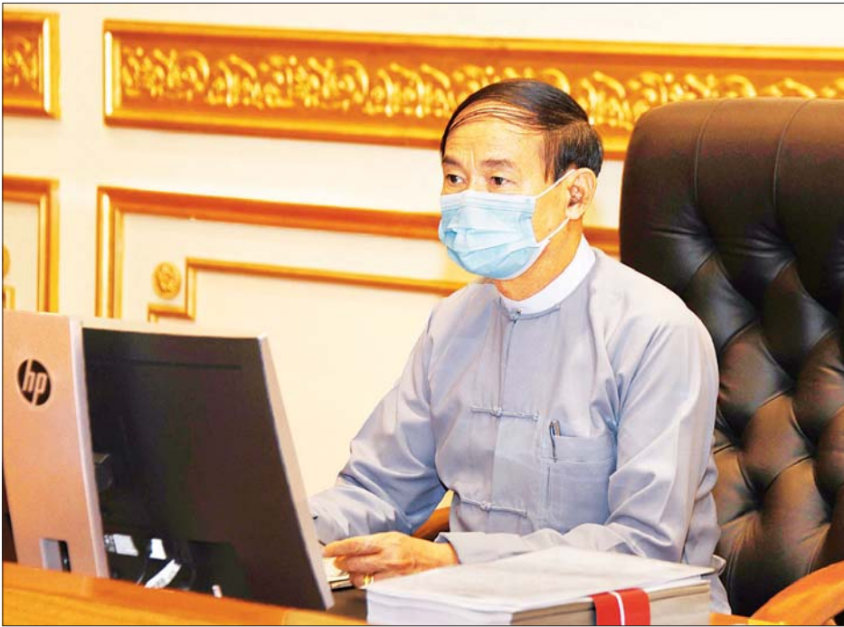
နိုင်ငံတော်သမ္မတ ဦးဝင်းမြင့် အမျိုးသားစီမံကိန်းကော်မရှင် (၁/၂၀၂၀) အစည်းအဝေးသို့ တက်ရောက်အမှာစကား ပြောကြားစဉ်။

နေပြည်တော် ၈ ဇွန် ၂၀၂၀ - အမျိုးသားစီမံကိန်းကော်မရှင် (၁/၂၀၂၀) အစည်းအဝေးကို ယနေ့နံနက် ၉ နာရီတွင် နိုင်ငံတော်သမ္မတအိမ်တော် ပြည်ထောင်စုအစိုးရအဖွဲ့ အစည်းအဝေးခန်းမ၌ ကျင်းပရာ အမျိုးသားစီမံကိန်းကော်မရှင်ဥက္ကဋ္ဌ ဦးဝင်းမြင့် တက်ရောက်၍ အမှာစကားပြောကြားသည်။ အစည်းအဝေးသို့ အမျိုးသားစီမံကိန်းကော်မရှင် ဒုတိယဥက္ကဋ္ဌများ ဖြစ်ကြသည့် ဒုတိယသမ္မတ ဦးမြင့်ဆွေ၊ ဒုတိယသမ္မတ ဦးဟင်နရီဗန်ထီးယူ၊ စီမံကိန်းကော်မရှင်အဖွဲ့ဝင် ပြည်ထောင်စုဝန်ကြီးများ၊ ပြည်ထောင်စုစာရင်းစစ်ချုပ်၊ ပြည်ထောင်စုရာထူးဝန်အဖွဲ့