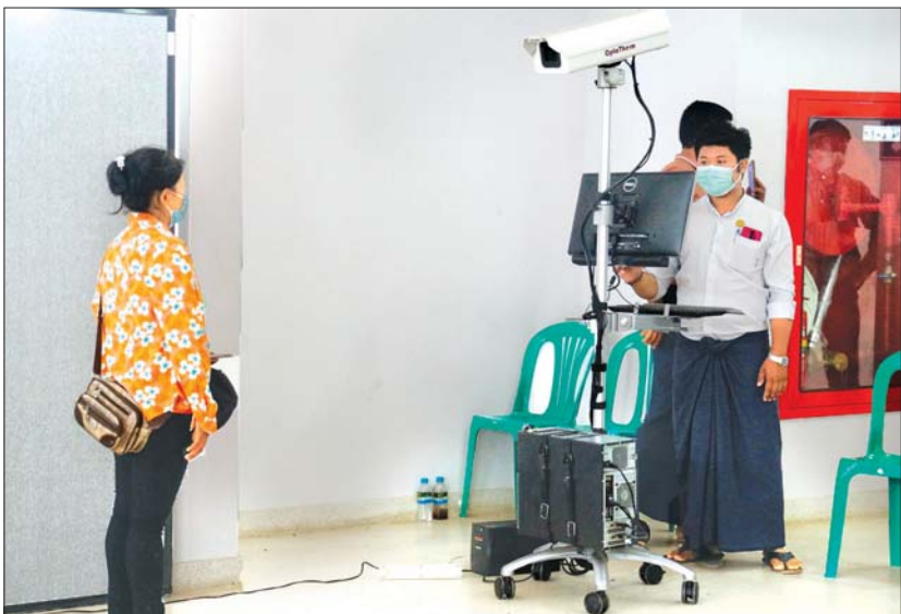
ပြန်လည်ဝင်ရောက်လာသူများအနေဖြင့် မေ ၁ ရက်က စတင်ကာ ဇွန် ၂၂ ရက်ထိ စုစုပေါင်း ၃၂၈၆၈ ဦးအထိ ပြန်လည်ဝင်ရောက်ခဲ့ပြီး ဖြစ်သည်။ ဇွန် ၂၂ ရက်က ပြန်လည်ဝင်ရောက်လာသူများ