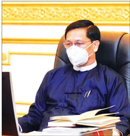
ဒုတိယသမ္မတ ဦးဟင်နရီဗန်ထီးယူ

တိုင်းဒေသကြီး/ပြည်နယ်များအနေဖြင့် စီမံကိန်း လုပ်ငန်းများ အချိန်မီပြီးစီးအောင် ဆောင်ရွက်နိုင်ရေး၊ ရန်ပုံငွေလွှဲပြောင်းသုံးစွဲမှုများ နည်းပါးစေရေးနှင့် ပိုလျှံငွေ အမြောက်အမြား ပြန်လည်အပ်နှံမှုမဖြစ်စေရေးတို့ကို ဂရုပြုဆောင်ရွက်သွားကြရန်လည်း တိုက်တွန်းပါကြောင်း။