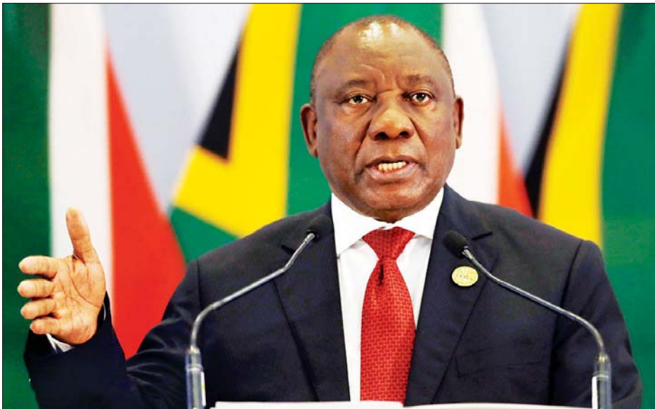
တောင်အာဖရိကသမ္မတ ရာမာဖိုးဆာ

ကီရီမီတောင်း ဇွန် ၂၂ ကိုဗစ်-၁၉ ဖြစ်ပွားမှုကြောင့် အလုပ် သမားဝန်ထမ်းများ ထိခိုက်နစ်နာနေရ ချိန် အလုပ်အကိုင်လျှော့ချရန် စီစဉ်နေသည့် ကုမ္ပဏီများအနေဖြင့် စီးပွားရေးလုပ်ငန်းများ ဆက်လက် တည်တံ့ရေးနှင့် အလုပ်သမားများ၏ စားဝတ်နေရေးတို့ကို မျှတတတချိန်ညှိ ဆောင်ရွက်ပေးရန် တောင်အာဖရိက သမ္မတ ရာမာဖိုးဆာက တိုက်တွန်း လိုက်ကြောင်း သိရသည်။