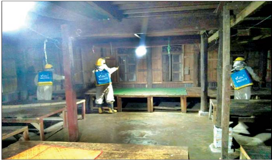
ဇွန် ၁၄ ရက်က တနင်္သာရီတိုင်းဒေသကြီး လောင်းလုံးမြို့နယ် အသွားအလာကန့်သတ်စောင့်ကြည့်ရေးစခန်းအဖြစ်ထားရှိသော မိုးကုတ်ဝိပဿနာတရားရိပ်သာတွင် COVID-19 ကာကွယ်ရေးအတွက် ပိုးသတ်ဆေးဖျန်းစဉ်။