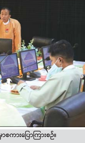
ပြည်နယ်ဝန်ကြီးချုပ် ဦးဆလှိုင်လျန်လွယ် အစည်းအဝေးတွင် အမှာစကားပြောကြားစဉ်။

ပြည်နယ်အတွင်း ဆောင်ရွက်နေသော မြေစီမံခန့်ခွဲရေး ဆိုင်ရာလုပ်ငန်းများကို ကဏ္ဍအလိုက်ရှင်းလင်းတင်ပြ သည်။ ထို့နောက် ကော်မတီအဖွဲ့ဝင်များက ကဏ္ဍ အလိုက် ဆွေးနွေးခဲ့ကြပြီး ဆွေးနွေးချက်များနှင့် ပတ်သက်၍ ကော်မတီဥက္ကဋ္ဌ ပြည်နယ်ဝန်ကြီးချုပ်က ဖြည့်စွက် ဆွေးနွေးခဲ့သည်။