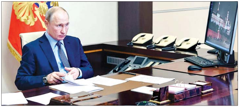
ရုရှားသမ္မတ ဗလာဒီမာပူတင်

သည် များပြားသောပမာဏ ဖြစ်သည်။ ဗီဒီယိုမှတစ်ဆင့် တစ်နိုင်ငံလုံးရှိ ဆေးဝန်ထမ်းများကို ဆက်သွယ်ပြောကြားမှုတွင် ရုရှားသမ္မတ ဗလာဒီမာပူတင် က လုပ်ဖော်ကိုင်ဖက်နှင့် ချစ်ခင်သူများကို ဆုံးရှုံးရသည့် အတွက် ဝမ်းနည်းကြောင်း ပြောကြားသည်။ အမှန်တကယ် ကြောက်စရာကောင်းသော ကူးစက် ရောဂါက လုပ်ဖော်ကိုင်ဖက်နှင့် ချစ်ခင်သူများကို လွတ်ငြိမ်း ချမ်းသာခွင့်ပေးမည်မဟုတ်ကြောင်း စိတ်မကောင်းစွာ ပြောကြားခဲ့ပြီး ကိုရိုနာဗိုင်းရပ်စ်ကပ်ရောဂါ ဖြစ်ပွားမှုတွင် အသက်ပေးဆပ်ခဲ့ရသည့် ဆရာဝန်များကို တကယ့် သူရဲကောင်းအစစ်များအဖြစ် တင်စားလိုက်သည်။ ကိုရိုနာဗိုင်းရပ်စ်ကပ်ရောဂါအတွင်း ကိုယ်ကျိုးမသည့် ဆေးဘက်ဆိုင်ရာ ဝန်ထမ်းများသည် ဆေးပညာလောကနှင့် နိုင်ငံသမိုင်းတွင် သမိုင်းတွင်မည့်သူများ ဖြစ်ကြောင်း ဗလာဒီမာပူတင်က ပြောကြားလိုက်သည်။ ရုရှားသမ္မတ ပူတင်က ဆေးဘက်ဆိုင်ရာဝန်ထမ်း များကို ပထမကမ္ဘာစစ်နှင့် ဒုတိယကမ္ဘာစစ်အတွင်း ရွပ်ရွပ် ချွံချွံ စွမ်းစွမ်းတစ် ကြိုးစားဆောင်ရွက်ခဲ့ကြသော ဆရာဝန် များ၊ သူနာပြုများနှင့် တန်းတူထားပြီး တင်စား