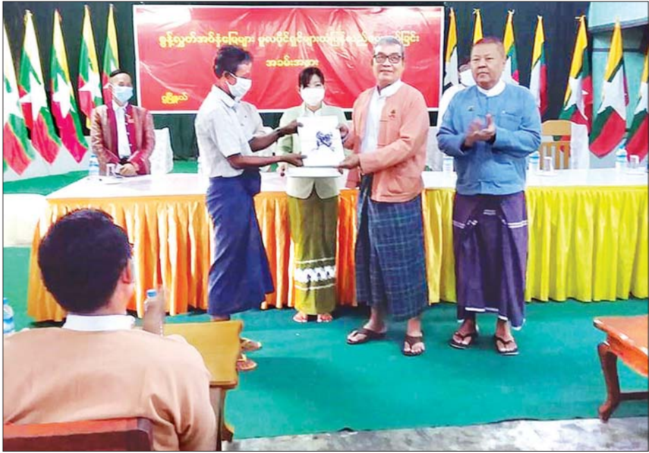
RC Box Culvert တစ်စင်း တည်ဆောက်ခြင်း လုပ်ငန်း သန်းဖြင့် ဆောင်ရွက်ခဲ့ခြင်းဖြစ်ကြောင်း သိရသည်။ များကို မိုးထိချမ်းသာကုမ္ပဏီက ငွေကျပ် ၃၅ ဒဿမ ၉၂၉ ဝေလင်း(ပြန်/ဆက်)

အဆိုပါ ကျောက်ချောလမ်းမှာ ၂၀၁၉-၂၀၂၀ ဘဏ္ဍာ ရေးနှစ်အတွင်း ကုလသမဂ္ဂဖွံ့ဖြိုးမှုအစီအစဉ် (UNDP) ထောက်ပံ့ရန်ပုံငွေဖြင့် ဆားချက်ကွင်း - ချောင်းသာကြီး လမ်းနှင့် ချောင်းသာကြီး - ပေါက်တူးလမ်းတို့တွင် ပါဝင် သည့် လမ်းအပိုင်း အရှည် ၉ မိုင်အား အကျယ် ၁၈ ပေ မြေသားလမ်းပြုပြင်ခြင်း၊ အကျယ် ၁၄ ပေနှင့် ထု ၆ လက်မ ရှိ ချောင်းဖြန်းကျောက်စရစ်ဖြင့် အမာခံလမ်းခင်းခြင်းနှင့် ရေမြောင်းတူးဖော်ခြင်း၊ RC Pipe Culvert ခြောက်စင်းနှင့်