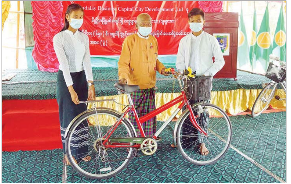
တိုင်းဒေသကြီးဝန်ကြီးချုပ် ဒေါက်တာဇော်မြင့်မောင် ကျောင်းသား ကျောင်းသူများအတွက် စက်ဘီးများပေးအပ် လှူဒါန်းစဉ်။

စက်ဘီး ၂၀၇ စီးကို ပေးအပ်လှူဒါန်းသည်။ ဆက်လက်၍ ကျောက်ဖူးကျေးရွာအထက(ခွဲ)ရှိ စာသင်ကျောင်းဆောင်သစ်အား တိုင်းဒေသကြီးဝန်ကြီး ချုပ်နှင့် တိုင်းဒေသကြီးဝန်ကြီးများက ဖဲကြိုးဖြတ်ဖွင့်လှစ် ပေးပြီး ကျောင်းသား ကျောင်းသူများအတွက် ကျောင်းသုံး ပစ္စည်းများ၊ ကျန်းမာရေးသုံးပစ္စည်းများ၊ အားကစား ပစ္စည်းများနှင့် ကျောင်းသား ကျောင်းသူများအတွက် စက်ဘီး ၄၄၃ စီးကို တိုင်းဒေသကြီး ဝန်ကြီးချုပ်နှင့် အလှူရှင်များက ပေးအပ်လှူဒါန်းသည်။ အဆိုပါ ကျောင်းများအတွက် ကျောင်းသုံးပစ္စည်းများ၊ ကျန်းမာရေးသုံးပစ္စည်းများနှင့် အားကစားပစ္စည်းများကို တိုင်းဒေသကြီးအစိုးရအဖွဲ့က ပေးအပ်လှူဒါန်းခြင်းဖြစ်ပြီး စက်ဘီးအစီး ၆၅၀ ကို Mandalay Business Capital Development Ltd. က လှူဒါန်းခြင်းဖြစ်ကြောင်း သိရ သည်။ ချမ်းသာ(မိတ္ထီလာ)