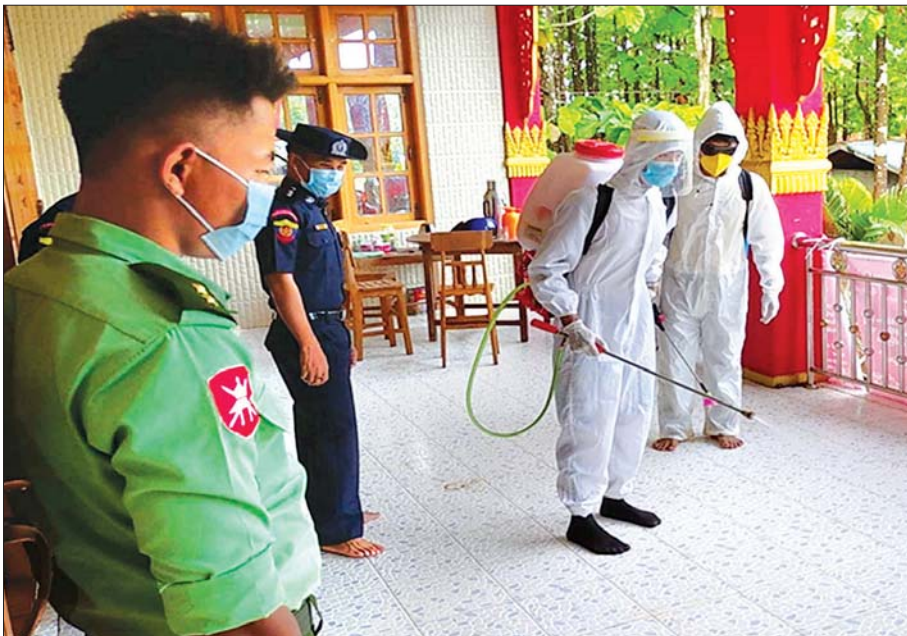
ဇွန် ၁၅ ရက်က စစ်ကိုင်းတိုင်းဒေသကြီး ဝန်းသိုမြို့နယ် အသွားအလာကန့်သတ်စောင့်ကြည့်ရေးစခန်းအဖြစ်ထားရှိသော ဘုန်းတော်ကြီးကျောင်းတိုက်အတွင်း COVID-19 ကာကွယ်ရေးအတွက် ပိုးသတ်ဆေးဖျန်းစဉ်။