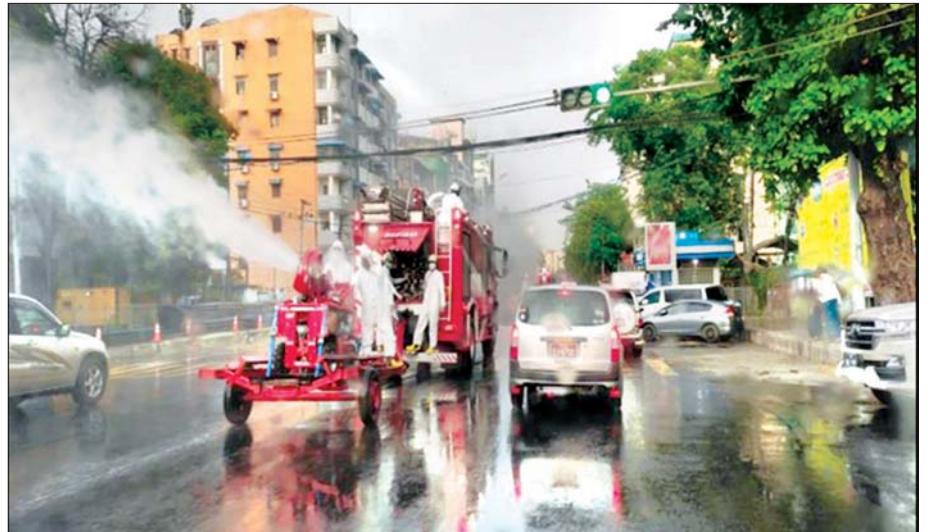
ဇွန် ၁၅ ရက်က ရန်ကုန်တိုင်းဒေသကြီး မရမ်းကုန်းမြို့နယ်အတွင်း COVID-19 ကာကွယ်ရေးအတွက် ပိုးသတ်ဆေးဖျန်းစဉ်။