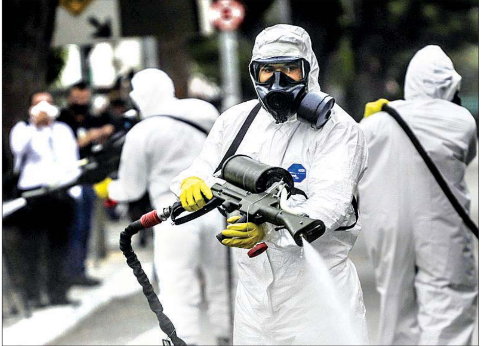
ဆော်ပေါလိုမြို့ ကွန်ဂိုဟက်စ်လေဆိပ်တွင် ဇွန် ၁၆ ရက်က ဆေးဖျန်းနေကြစဉ်။