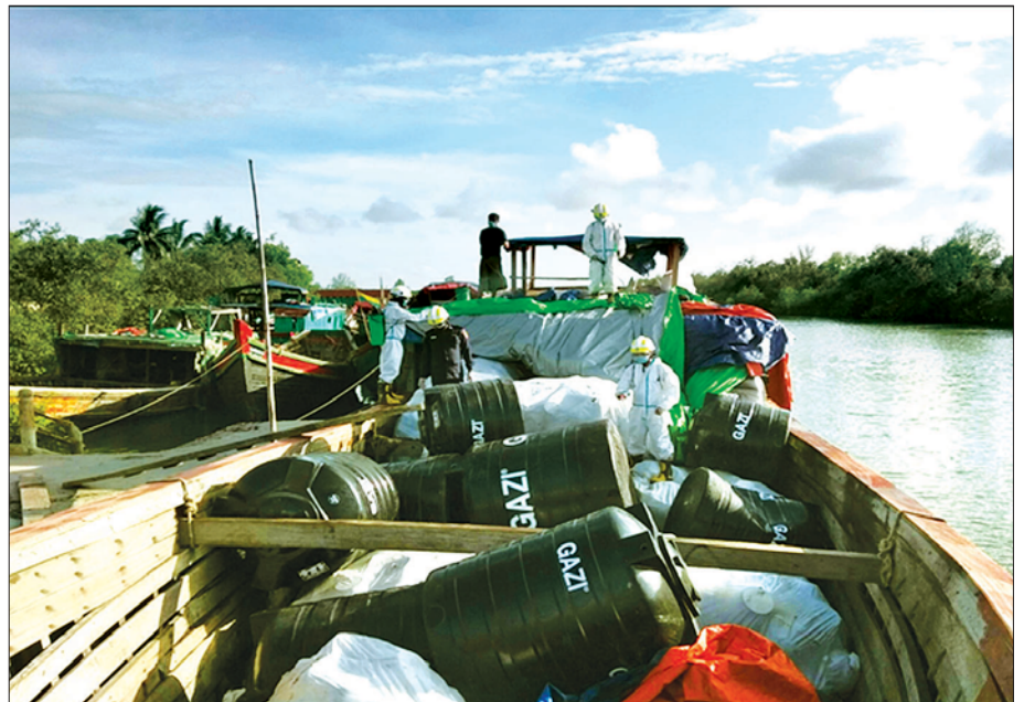
ဇွန် ၁၅ ရက်က ရခိုင်ပြည်နယ် မောင်တောမြို့ အမှတ်(၁)နယ်စပ်အဝင်အထွက်စခန်းအား COVID-19 ကာကွယ်ရေးအတွက် ပိုးသတ်ဆေးဖျန်းစဉ်။