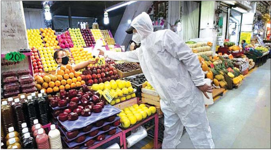
မက္ကဆီကိုစီးတီးမြို့တွင် ကျန်းမာရေးလုပ်သားတစ်ဦးက ဈေးသည်ကို လက်သန့်ဆေးရည်ပေးနေစဉ်။