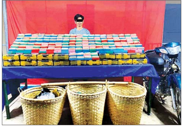
ဇော်မြတ် အား ဖမ်းဆီးရမိသည့် ဘိန်းဖြူးများနှင့်အတူ တွေ့ရစဉ်။

မူးယစ်ဆေးဝါးတားဆီးနှိမ်နင်းရေးရဲတပ်ဖွဲ့မှ တပ်ဖွဲ့ဝင်များ ပါဝင်သော ပူးပေါင်း အဖွဲ့သည် ဇွန် ၁၉ ရက် မွန်းလွဲပိုင်းက ဖြူးမြို့နယ် သစ်ခြောက်ခင်ကျေးရွာနေ