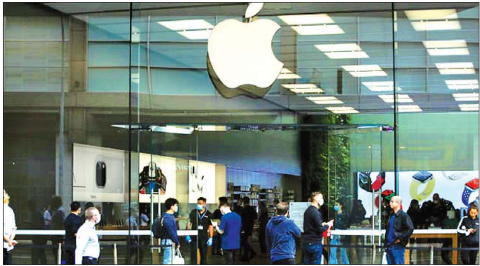
အရီဇိုးနားပြည်နယ်ရှိ အက်ပဲလ်ဆိုင်ခွဲတစ်ဆိုင်ကို တွေ့ရစဉ်။

အခြေအနေများ ပြန်လည် ကောင်းမွန်လာပါက အမြန်ဆုံး