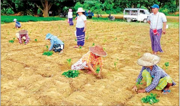
စီပင်စိုက်ပျိုးရေးသုတေသနဌာန စမ်းသပ်ကွက်တွင် အထွက်နှုန်းကောင်းသည့် ငရုတ်မျိုးများ စိုက်ပျိုးနေစဉ်။