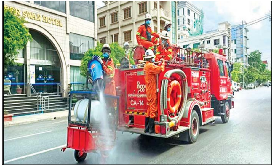
ဇွန် ၁၄ ရက်က မန္တလေးတိုင်းဒေသကြီး ချမ်းအေးသာစံမြို့နယ်အတွင်း COVID-19 ကာကွယ်ရေးအတွက် ပိုးသတ်ဆေးဖျန်းစဉ်။