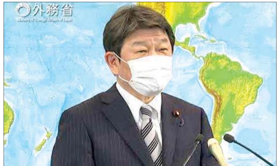
ဂျပန်နိုင်ငံခြားရေးဝန်ကြီး တိုတရို ဘိုဂိုမိဆု

ရုရှားနိုင်ငံတွင် ကိုရိုနာဗိုင်းရပ်စ်ကြောင့် လူပေါင်း ၈၀၀၀ ကျော် သေဆုံးခဲ့ပြီး ကူးစက်ခံရသူပေါင်း ၅၇၇၀၀၀ ရှိပြီး အမေရိကန်ပြည်ထောင်စုနှင့် ဘရာဇီးနိုင်ငံပြီးလျှင် ကမ္ဘာပေါ်တွင် ကိုရိုနာဗိုင်းရပ်စ် ကူးစက်မှု တတိယ အများဆုံး နိုင်ငံတစ်နိုင်ငံဖြစ်သည်။ အေအက်ဖ်ပီ