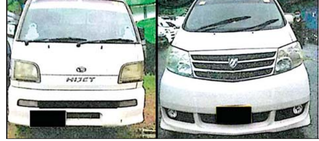
တရားဝင် စာရွက်စာတမ်း အထောက်အထား တင်ပြနိုင်ခြင်းမရှိသည့် လိုင်စင်မဲ့ယာဉ်များ။