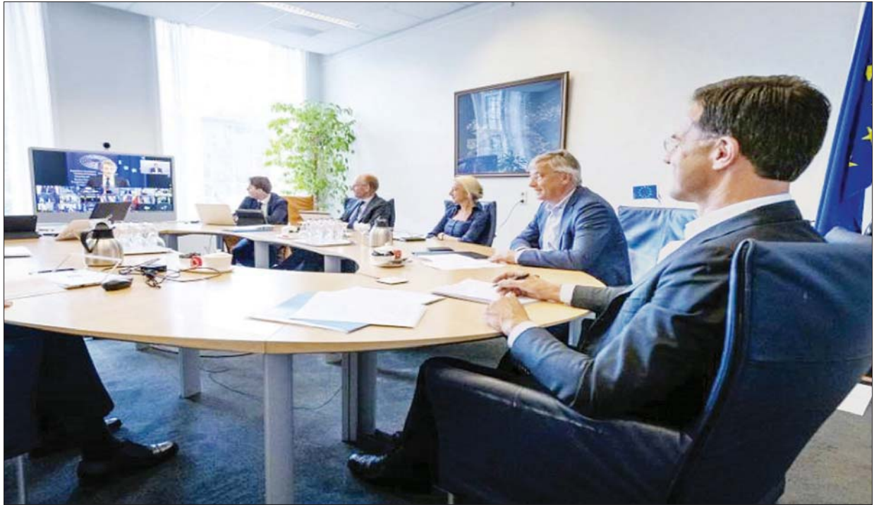
အီးယူခေါင်းဆောင်များ ဇွန် ၁၉ ရက်က ဗီဒီယိုအစည်းအဝေးပြုလုပ်နေစဉ်။

“စီးပွားရေးပြန်လည်ဦးမော့ရေးအစီအစဉ်ကို ကူညီဖို့ဆိုရင် တိကျတဲ့ အရင်းအမြစ်တစ်ခုတော့ရှိဖို့ လိုအပ်ပါတယ်။ အဲဒီလို မဟုတ်ဘူးဆိုရင်တော့ ဓာတ်ဆီမရှိတဲ့ စက်တစ်လုံးနဲ့ ဘာမှ မထူးပါဘူးလို့ တချို့က သတိပေးထားပါတယ်။ သို့သော်လည်း ဒါကိုသက်သေပြဖို့ဆိုရင် တချို့အီးယူအဖွဲ့ဝင်နိုင်ငံတွေ အနေနဲ့ ခက်ခဲမှုတွေ ရှိကောင်းရှိနိုင်ပါတယ်။ ဒီအစီအစဉ်ဟာ သတ်မှတ်ထားသလို ဖြစ်လာရင်တော့ အီးယူရဲ့စီးပွားရေးဟာ ပြန်လည်ဦးမော့လာမှာ ဖြစ်ပါတယ်”