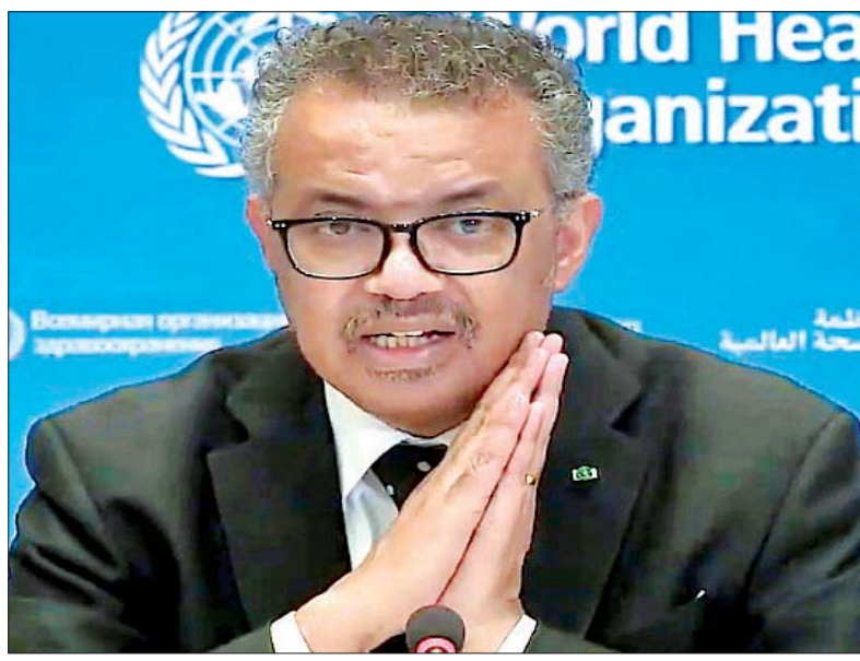
ကမ္ဘာ့ ကျန်းမာ ရေးအဖွဲ့ အကြီး အကဲ တက်ဒ ရော့စ်

သူများဖြစ်ရမည်ဖြစ်ပြီး တခြားအခြေအနေများနှင့်လည်း ကိုက်ညီရမည်ဖြစ်ကြောင်း သိရသည်။ ကိုဗစ်-၁၉ ကပ်ရောဂါ ကူးစက်ပြန့်ပွားမှုကို အပြည့်အဝနီးပါးထိန်းချုပ်နိုင်ခဲ့သည့် ဗီယက်နမ်နိုင်ငံကို မဟာဗျူဟာမြောက် သံတမန်မိတ်ဖက်အဖြစ် ဂျပန်က ရှုမြင်ထားသည်။ ထို့အပြင် ဂျပန်အစိုးရသည် ထိုင်း၊ ဩစတြေးလျ၊ နယူးဇီလန်နိုင်ငံများ၏ ပြည်ပဝင်ခွင့် ကန့်သတ်မှုများကို ဖြေလျှော့ပေးရန်လည်း ညှိနှိုင်း ဆောင်ရွက်နေကြောင်း သိရသည်။ ထိုင်းနိုင်ငံကိုလည်း ပြည်ပဝင်ခွင့်ကန့်သတ်မှုများ ဖြေလျှော့ပြီး ပြန်လည်ခွင့်ပြုပေးရန် စဉ်းစားသုံးသပ်လျက် ရှိကြောင်း ဂျပန်နိုင်ငံခြားရေးဝန်ကြီးက သတင်းထောက် များကို ပြောကြားလိုက်သည်။ ဂျပန်အစိုးရအနေဖြင့် နိုင်ငံတစ်နိုင်ငံချင်းစီ၏ အခြေအနေများကို ပြည့်ပြည့်စုံစုံစုံစုံစုံလေ့လာပြီး ကန့်သတ်မှု များကို ဖြေလျှော့သွားရန် မျှော်လင့်ထား ကြောင်း မစ္စတာ ဗိုတရီက ပြောသည်။ အင်န်အိတ်ချီကေ