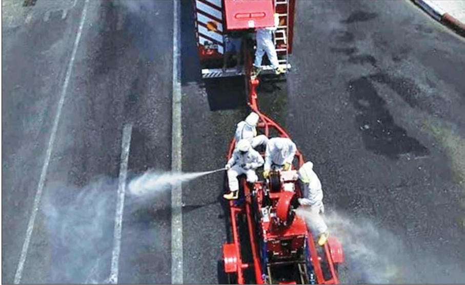
ဇွန် ၁၄ ရက်က ရန်ကုန်တိုင်းဒေသကြီး စမ်းချောင်းမြို့နယ်အတွင်း COVID-19 ကာကွယ်ရေးအတွက် ပိုးသတ်ဆေးဖျန်းစဉ်။

အလားတူ ဇွန် ၁၅ ရက်ကလည်း နေပြည်တော်၊ တိုင်းဒေသကြီး/ပြည်နယ်များမှ မြို့နယ် ၃၉ မြို့နယ်ရှိ နေရာ ၇၉ နေရာများတွင် မီးသတ်ယာဉ်များ၊ မီးသတ်ပစ္စည်းကိရိယာများဖြင့် ပိုးသတ်ဆေးဖျန်းခြင်းများ ဆောင်ရွက်ခဲ့ရာ ပိုးသတ်ဆေးရည် ၆၇ ဂါလန်နှင့် ပိုးသတ်ဆေးမှုန့် ၃၇ ကီလိုဂရမ်သုံးစွဲခဲ့ကြောင်း သိရသည်။ သတင်းစဉ်