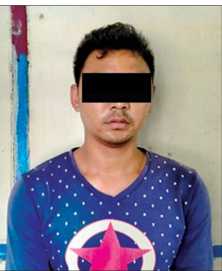
ပြစ်မှုကျူးလွန်သူ ချစ်ကို (ခ) ပိုင်စိုးအောင်