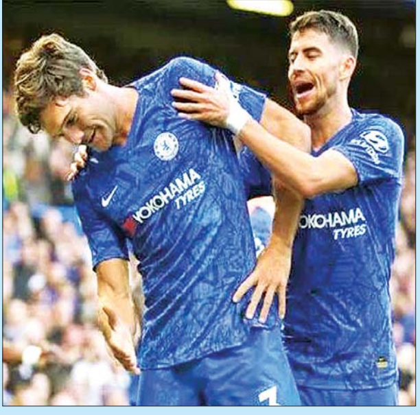
စာမျက်နှာ ၁၁ ကော်လံ ၄ ❖

အီတလီစီးရီးအေကလပ် ဂျပန်ပင်တပ်စ်အသင်းသည် ချယ်လ်ဆီးအသင်းမှ ကွင်းလယ်ကစားသမား ဂျော်ဂျင်ဟိုနှင့် ဘယ်ခဲစစ်ကစားသမား မားကိုစ် အလွန်ဆိုကိုကို ခေါ်ယူနိုင်ရန်အတွက် အသင်းမှ ကစားသမားနှစ်ဦးအပြင် ငွေသား အလိုက်ပေးကမ်းလှမ်းရန် ပြင်ဆင်နေကြောင်း သတင်းများတွင် ဖော်ပြထားသည်။ နည်းပြဆာရီသည် ဂျပန်ပင်တပ်စ်အသင်းသို့ ပြန်လည် မပြောင်းရွှေ့မီတွင် စတန်းဖို့ဒ်ဘရစ်၌ တစ်နှစ်ကြာ ဖြတ်သန်းခဲ့သူဖြစ်သည်။ ထို့ကြောင့် ဆာရီသည် အဆိုပါကွင်းလယ်ကစားသမားနှင့် ဘယ်ခဲစစ်ကစားတို့၏ ခြေစွမ်းကို ကြိုက်နှစ်သက်သည့်အတွက် ဂျပန်ပင်တပ်စ်အသင်းသို့ ခေါ်ယူရန် ကြိုးပမ်းနေခြင်းဖြစ်သည်။ ဂျပန်ပင်တပ်စ်အသင်းသည် ကိုဗစ် - ၁၉ ကြောင့် အသင်းဘဏ္ဍာရေးထိခိုက် သည့် အသင်းများထဲတွင် တစ်သင်းအပါအဝင်ဖြစ်လင့်ကစား နွေရာသီအပြောင်း အရွှေ့ကာလတွင် နည်းပြဆာရီ ခေါ်ယူရန် ဆန္ဒရှိနေသည့် ကစားသမားများ ကို အသင်းသို့ခေါ်ယူဆောင်ကြဉ်းပေးနိုင်ရန် စိတ်အားထက်သန်နေကြောင်း သိရသည်။ ဆာရီသည် ၂၀၁၈ ခုနှစ်တွင် နာပိုလီအသင်းမှ ထွက်ခွာပြီး ချယ်လ်ဆီး အသင်းသို့ ပြောင်းရွှေ့ရောက်ရှိလာပြီးနောက်တွင် ဂျော်ဂျင်ဟိုကို ခေါ်ယူခဲ့ ကာ ချယ်လ်ဆီးအသင်းပရိသတ်များက ဝေဖန်မှုများရှိခဲ့သည့်တိုင် ဂျော်ဂျင်ဟို ကို ပုံမှန်ပွဲထွက်ကစားစေခဲ့ကြောင်း သိရသည်။ တူရင်၌ ဝိဂျာနစ်၏အနာဂတ် သံသယဖြစ်စရာအနေအထားဖြစ်လာခဲ့ ခြင်းကြောင့် ဂျပန်ပင်တပ်စ်အသင်းအနေဖြင့် ၎င်းတို့၏ ကွင်းလယ်အင်အားကို ဖြည့်တင်းလုပ်ဆောင်ဖွယ်ရှိနေခြင်းဖြစ်သည်။ ထို့အပြင် ဂျပန်ပင်တပ်စ်အသင်း သည် ဘယ်ခဲစစ်ကစားသမားနေရာကို အလွန်ဆိုဖြင့် ဖြည့်တင်းလိုနေသည်။ အလွန်ဆိုသည် နည်းပြလမ်းပတ်လက်အောက်၌ ပုံမှန်ပွဲထွက်ခွင့်ပျောက်ဆုံး နေသူဖြစ်ကြောင်း သိရသည်။