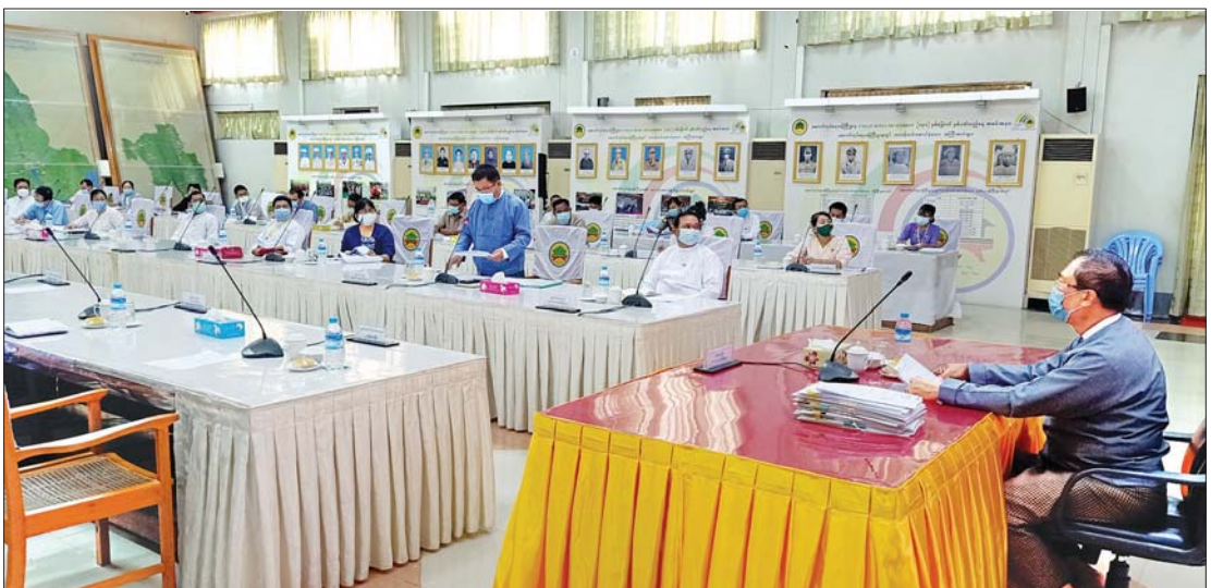
နေပြည်တော်ကောင်စီနယ်မြေ ဒက္ခိဏသီရိမြို့နယ် သုခဝတီအိမ်ရာတွင် နိုင်ငံ့ဝန်ထမ်းအငြိမ်းစားများအား မဲနှိုက်နေရာချထားပေးသည့် အခမ်းအနားကျင်းပစဉ်။

သည့် သတင်းမီဒီယာများ တက်ရောက်ကြသည်။ အခမ်းအနားတွင် အိမ်ခန်းနေရာချထားရေးကော်မတီဥက္ကဋ္ဌ ဒုတိယဝန်ကြီး ဒေါက်တာ ကျော်လင်းက နိုင်ငံ့ဝန်ထမ်းအငြိမ်းစားများအား မဲနှိုက်နေရာချထားပေးသည့် အခမ်းအနားအား မန္တလေးမြို့တွင် မန္တလေးတိုင်းဒေသကြီးအစိုးရအဖွဲ့၏အစီအစဉ်ဖြင့် အခန်းပေါင်း ၂၄၀ အား လက်ရှိ တာဝန်ထမ်းဆောင်နေသည့် နိုင်ငံ့ဝန်ထမ်းများသို့ အငှားချထားပေးပြီး ဖြစ်ပါကြောင်း၊ အလားတူ ရန်ကုန်တိုင်းဒေသကြီးတွင်လည်း အခန်းပေါင်း ၁၃၆ ခန်းကို လက်ရှိတာဝန်ထမ်းဆောင်ဆဲ နိုင်ငံ့ဝန်ထမ်းများအား အငှားချထားပေးရန် ဆောင်ရွက်လျက်ရှိပါကြောင်း၊ ယနေ့ နေပြည်တော်တွင် ပထမဆုံး အကြိမ် နိုင်ငံ့ဝန်ထမ်းအငြိမ်းစား ဦးရေ ၃၀၀ အတွက် အိမ်ခန်းနေရာချထားပေးသည့် အခမ်းအနားဖြစ်ပါကြောင်း။ ယခုအချိန်အခါသည် ကိုဗစ်-၁၉ ကာလ