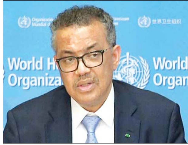
ကမ္ဘာ့ကျန်းမာရေးအဖွဲ့အကြီးအကဲ တက်ဒရော့စ် အာဒါနွန် ဂီဘာရီယက်စ်ဆစ်

အဆိုပါကိစ္စကို ကိုင်တွယ်ဖြေရှင်း နိုင်ရေး ကမ္ဘာ့ကျန်းမာရေးအဖွဲ့ကြီးက ကျွမ်းကျင်မှုများကို ပိုမိုထောက်ပံ့ပေးမည်ဖြစ်သလို တရုတ်နိုင်ငံရှိ ကမ္ဘာ့ကျန်းမာရေးအဖွဲ့ရုံးတွင်လည်း ကူးစက်ရောဂါ ပြန့်ပွားခြင်းနှင့် ကာကွယ်ခြင်းဆိုင်ရာ ပညာရှင်များက အဆိုပါကိစ္စကို ကိုင်တွယ်ဖြေရှင်းမည်ဖြစ်ကြောင်း သတင်းရရှိသည်။ အင်နီအိတ်ချ်ကေ