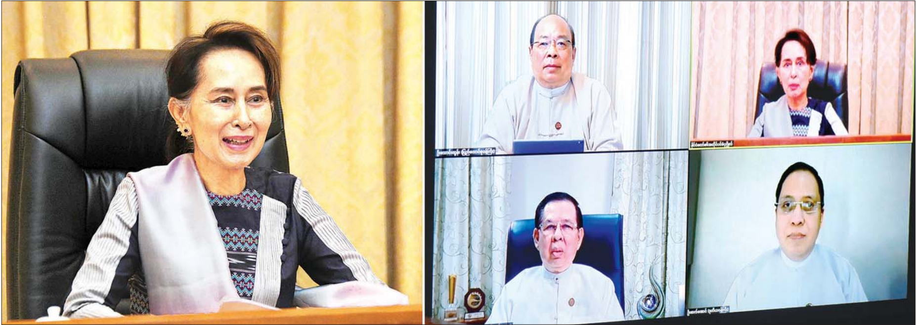
နိုင်ငံတော်၏အတိုင်ပင်ခံပုဂ္ဂိုလ် ဒေါ်အောင်ဆန်းစုကြည် COVID-19 ကြောင့် ဖြစ်ပေါ်လာသည့် စီးပွားရေးသက်ရောက်မှုများအပေါ် ကုစားရေးဆိုင်ရာများနှင့်စပ်လျဉ်း၍ စီးပွားရေးသက်ရောက်မှုများအပေါ် ကုစားရေးလုပ်ငန်း ကော်မတီဥက္ကဋ္ဌ၊ ရင်းနှီးမြှုပ်နှံမှုနှင့် နိုင်ငံခြားစီးပွားဆက်သွယ်ရေးဝန်ကြီးဌာန ပြည်ထောင်စုဝန်ကြီး ဦးသောင်းထွန်း၊ COVID-19 စီးပွားရေးထိခိုက်မှု သက်သာရေးစီမံချက်(CERP)နှင့် Economic Recovery Plan ရေးဆွဲသူ စီမံကိန်း၊ ဘဏ္ဍာရေးနှင့် စက်မှုဝန်ကြီးဌာန ဒုတိယဝန်ကြီး ဦးဆက်အောင်၊ ပြည်ထောင်စုသမ္မတမြန်မာနိုင်ငံ ကုန်သည်များနှင့် စက်မှုလက်မှုလုပ်ငန်းရှင်များအသင်းချုပ်ဥက္ကဋ္ဌ ဦးဇော်မင်းဝင်းတို့နှင့် Video Conferencing စနစ်ဖြင့် ချိတ်ဆက်တွေ့ဆုံပြီး လက်တွေ့အခြေအနေများအား အပြန်အလှန် ဆွေးနွေးစဉ်။

COVID-19 ကြောင့် ဖြစ်ပေါ်လာသည့် စီးပွားရေးသက်ရောက်မှုများအပေါ် ကုစားရေးဆိုင်ရာများနှင့် စပ်လျဉ်း၍ အပြန်အလှန်ဆွေးနွေး