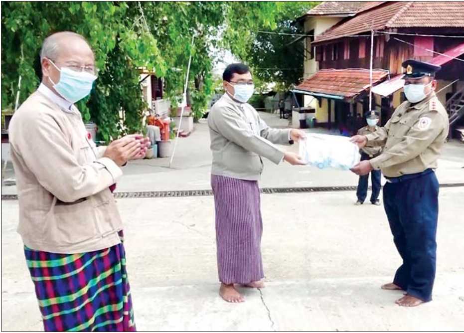
ပြည်ထောင်စုဝန်ကြီး ဒေါက်တာဝင်းမြတ်အေး အသွားအလာကန့်သတ်နေရာများရှိ ကိုယ်ဝန်ဆောင်၊ ကလေးငယ် နှင့် သက်ကြီးရွယ်အိုများအတွက် ထောက်ပံ့ပေး အပ်စဉ်။