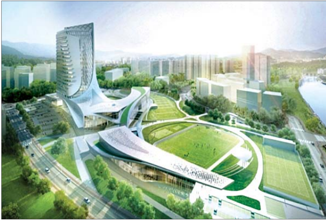
ကိုရီးယား-မြန်မာ စက်မှုဥယျာဉ်မြို့တော်ပုံစံပုံရိပ်။

မိုးယ ကို ထိုးထွက်နေတဲ့ အထပ်မြင့်တိုက်တာ အဆောက်အအုံတွေ ရန်ကုန်မြို့လယ်မှာ တဖြည်းဖြည်းနဲ့ များလာတာ သတိပြုနေမိပါတယ်။ အသစ်ဆောက်လုပ်လက်စ အထပ်မြင့် စီမံကိန်းတွေရှိနေသလို အကောင်အထည်ဖော်ဖို့ရှိနေတဲ့ စီမံကိန်းတွေလည်း တန်းစီနေပါတယ်။ ရန်ကုန်မြို့လယ်မှာ ဒီလိုစီမံကိန်းတွေ ရှိနေသလို ရန်ကုန်မြို့ပြင် ဆင်ခြေဖွံ့ဖြိုးနယ်တွေမှာလည်း ဖွံ့ဖြိုးတိုးတက်ရေး စီမံကိန်းတွေ ရှိနေပါတယ်။ အခုဆိုရင် လှည်းကူးမြို့နယ်မှာရှိတဲ့ ကိုရီးယား-မြန်မာ စက်မှုဥယျာဉ် စီမံကိန်းဟာ အကောင်အထည်ဖော်တော့မှာ ဖြစ်ပါတယ်။