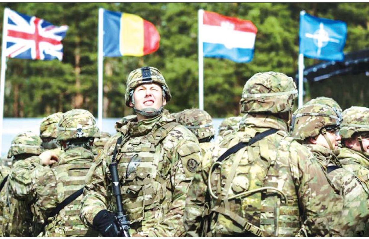
နေတိုးမဟာမိတ်အဖွဲ့ဝင်နိုင်ငံဖြစ်သည့် ဂျာမနီ၌ချထားသည့် အမေရိကန်တပ်ဖွဲ့ဝင်များကို တွေ့ရစဉ်။

ကုန်ကျစရိတ်ကြီးမား ဂျာမနီနိုင်ငံမှာ ချထားတဲ့ အမေရိကန်တပ်ဖွဲ့ဝင် အရေအတွက် ၅၂၀၀၀ အထိရှိပြီး ဒီထက်တပ်ဖွဲ့ဝင် ၂၅၀၀၀ လောက်ကို ပြန်လျှော့မယ် ဆိုပြီး ထရမ်က သတင်းထောက်တွေ ကို ပြောကြားခဲ့တာ ဖြစ်ပါတယ်။ တပ်ဖွဲ့ဝင်တွေချထားရတဲ့ ကုန်ကျ စရိတ်က မသေးဘူး။ ဒါကြောင့် အရေအတွက်လျှော့ချဖို့ လုပ်နေတာ ဖြစ်တယ်လို့ ၎င်းကဆိုပါတယ်။ သမ္မတထရမ် ဖော်ပြတဲ့ တပ်ဖွဲ့ဝင် အရေအတွက်ဟာ တကယ်တော့ အမှန်မဟုတ်ဘူး။ ဘာကြောင့်လဲဆိုတော့ ဂျာမနီမှာ အမှန်တကယ် တပ်ဖွဲ့ထားတဲ့ အမြဲတမ်းတပ်ဖွဲ့ဝင် အရေအတွက် က ၃၄၀၀၀ နဲ့ ၃၅၀၀၀ အတွင်းသာ ရှိတယ်လို့ ပင်တဂွန်စစ်ဌာနက ပြောကြားခဲ့ပါတယ်။ တပ်ဖွဲ့ဝင် အရေအတွက် အားလုံးပေါင်း ၅၀၀၀၀ ကျော်ရှိတဲ့အချိန်ဟာ ယာယီလောက်သာ ဖြစ်တယ်လို့ သိရပါတယ်။