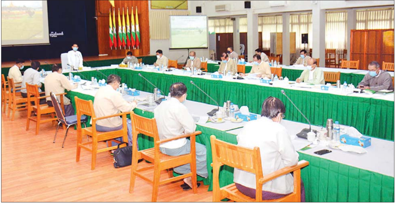
ပြည်ထောင်စုဝန်ကြီး ဒေါက်တာအောင်သူ ဗဟိုလယ်ယာမြေစီမံခန့်ခွဲမှုအဖွဲ့၏ (၂၉) ကြိမ်မြောက် လုပ်ငန်းညှိနှိုင်းအစည်းအဝေးတွင် အမှာစကားပြောကြားစဉ်။

ထို့အပြင် လယ်ယာမြေအငြင်းပွားမှုဖြစ်စဉ်များ ဖြေရှင်းခြင်းအပါအဝင် အခြားနည်း အသုံးပြုခွင့်လျှောက်ထားခြင်းလုပ်ငန်းများအား ဥပဒေ၊ နည်းဥပဒေပါ ပြဋ္ဌာန်းချက်နှင့်အညီ ကြန့်ကြာမှုမရှိစေဘဲ ဆောင်ရွက်ပေးရန်လိုအပ်ကြောင်း၊ သို့မှသာ အမှန်တကယ်ရင်းနှီးမြှုပ်နှံမည့်သူများအတွက် လုပ်ငန်းဆောင်ရွက်မှု အဟန့်အတားမဖြစ်စေဘဲ တစ်ဖက်တွင်လည်း နိုင်ငံတော်၏ စီးပွားရေးကဏ္ဍဆိုင်ရာဖွံ့ဖြိုးတိုးတက်ရေးကို အထောက်အကူ ဖြစ်စေနိုင်မည်ဖြစ်ကြောင်း ဆွေးနွေးပြောကြားသည်။