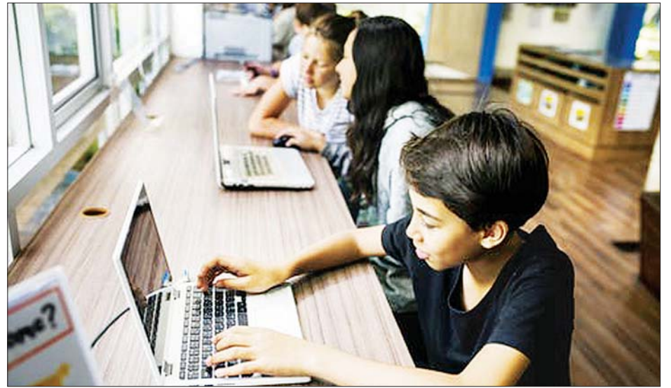
ဩစတြေးလျ၌ အင်တာနက်အသုံးပြုနေသည့် လူငယ်အချို့ကို တွေ့ရစဉ်။