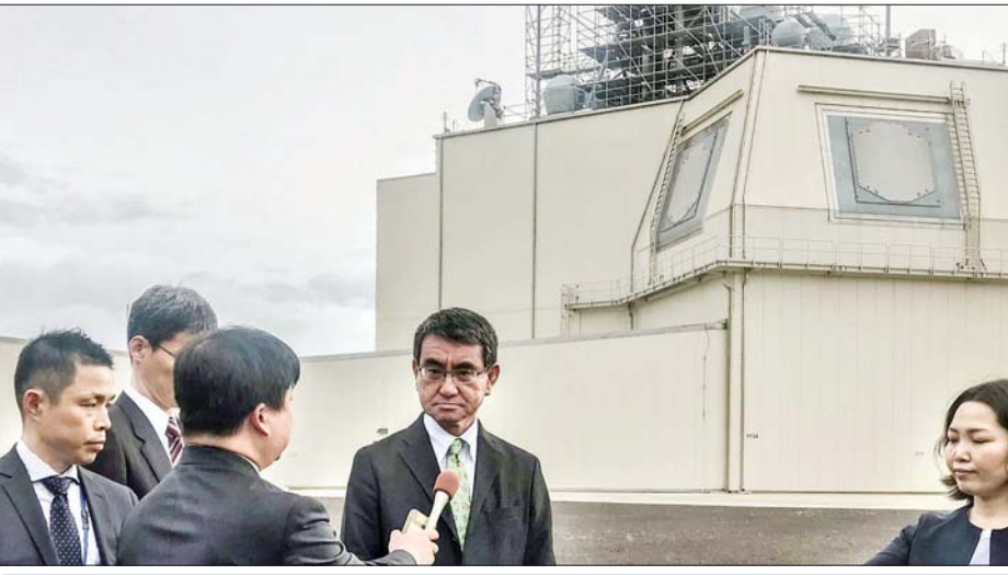
ဂျပန်ကာကွယ်ရေးဝန်ကြီး တာရိုကိုနို

ဌာနအရာရှိများက ဝန်ခံပြောကြားသည်။ ကုန်ကျစရိတ်နှင့် အချိန်အဆင်သင့် မဖြစ်သေးမှုကြောင့် ခုံးကျည်ဖြန့်ကြက်မှုကို ခဏတာ ရပ်ဆိုင်းထားမည် ဖြစ်ကြောင်း ကိုနိုက သတင်းထောက်များကို ပြောကြားလိုက်သည်။ အင်နီအိတ်ချ်ကေ