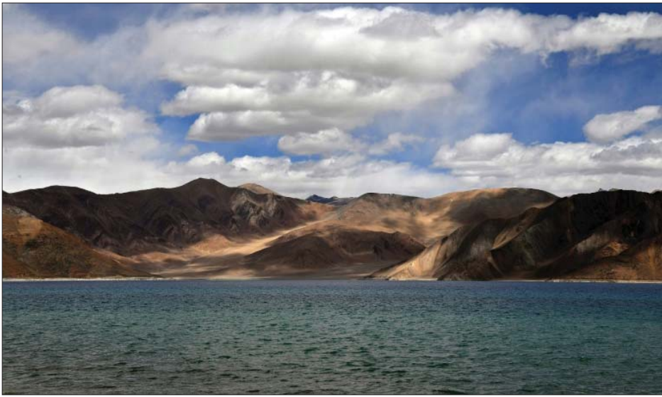
လက်ဒါရီဒါရီရီ ပန်းပွန်းရေကန်ကို တွေ့ရစဉ်။