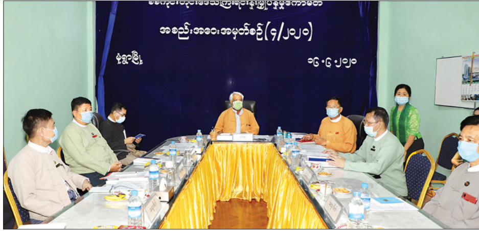
စစ်ကိုင်းတိုင်းဒေသကြီး ရင်းနှီးမြှုပ်နှံမှုကော်မတီ၏ (၄/၂၀၂၀) ကြိမ်မြောက် အစည်းအဝေး ကျင်းပစဉ်။