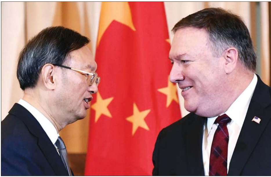
အမေရိကန်နိုင်ငံခြားရေးဝန်ကြီးဌာန ဝန်ကြီးမိုက်ပွန်ပီအိုနှင့် တရုတ်ပေါ့လစ်တီကိုအဖွဲ့ဝင် ယန်ဂျီချီတို့ ၂၀၁၈ ခုနှစ် နိုဝင်ဘာလက ဝါရှင်တန်အစည်းအဝေးတွင် တွေ့ဆုံနှုတ်ဆက်နေစဉ်။