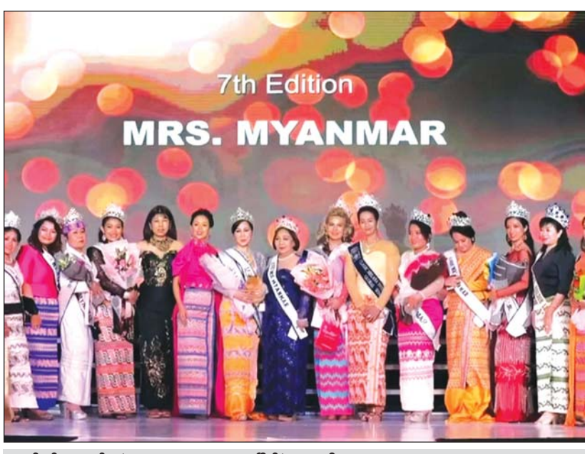
ယခင်နှစ်က ကျင်းပခဲ့သော Mrs. Myanmar ပြိုင်ပွဲမှ ဆုရရှိသူများ

ပြိုင်ပွဲတွင် ပါဝင်ယှဉ်ပြိုင်လိုသူများအနေဖြင့် Mrs. Myanmar ၏ ဖေ့ဘွတ်စာမျက်နှာသို့ ဝင် ရောက်၍ Message Box မှတစ်ဆင့် အမည်၊ အသက်၊ ဖုန်းနံပါတ်၊ နေရပ်လိပ်စာနှင့်အတူ စိတ်ကြိုက် အလှ ဓာတ်ပုံ သုံးပုံကို ပေးပို့၍ ပါဝင်ယှဉ်ပြိုင်နိုင်ကြောင်း၊