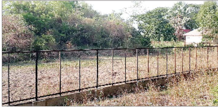
တောင်ဘက်မြို့ရိုးနှင့်ကျုံး(ရန်အောင်မြင်မြို့)။

မင်းကြီးညို ရေလွှဲ ၅ ခရိုင်ကို တိုက်ခိုက်စဉ်က ရန်အောင်မြင် မြို့တိုက်ပွဲကို မင်းတရားရွှေထီး နားတော် သွင်း ဧချင်းတွင် ဤကဲ့သို့ ဖွဲ့ဆိုပါသည်။ ဗိုလ်လူရဲမက၊ အုတ်ကျက်စည်ပင်၊ ရန်အောင်မြင်၌၊ မြင်းဆင်ထွေပြီ၊ အနီးတန်ဆာ၊ လွှားကာဆက်ကြပ်၊ အထပ်ထပ်တံ၊