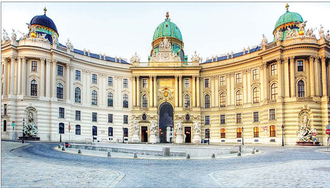
ဩစတြီးယားနိုင်ငံ ဝီယင်မြို့ရှိ ထင်ရှားသော နန်းတော်ကြီးဖြစ်သည့် ဝီယင်နာဟော့စ်ဘာဂျက်တွေရစဉ်။