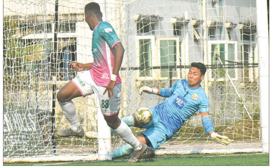
၂၀၂၀ ရာသီ MNL ပွဲစဉ်တစ်ခု တွေ့ရစဉ်။

လျက်ရှိသည်။ မြန်မာနေရှင်နယ်လိင်ကော်မတီသည် ပြည်တွင်းပြိုင်ပွဲများ ပြန်လည်