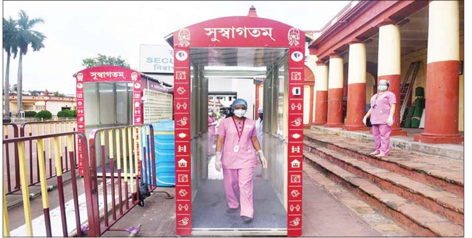
ကိုလံကတ္တားမြို့ရှိ ဘုရားကျောင်းတစ်ခုတွင် တာဝန်ထမ်းဆောင်နေသည့် ကျန်းမာရေးဝန်ထမ်းအချို့ကို တွေ့ရစဉ်။

ယခုလက်ရှိတွင် ဘင်္ဂလားဒေ့ရှ်နိုင်ငံတစ်ဝန်း ကိုဗစ်- ၁၉ ကူးစက်ခဲ့သူအရေအတွက် စုစုပေါင်းမှာ ၇၈၀၅၂ ဦးရှိပြီဖြစ်ကြောင်း ကျန်းမာရေးဝန်ကြီးဌာနလက်အောက်ရှိ ကျန်းမာရေးဝန်ဆောင်မှုဆိုင်ရာ အထွေထွေညွှန်ကြားမှု တွဲဖက် အကြီးအကဲပါမောက္ခနာဆီမာစူလ်တန်နာက ပြောကြားခဲ့သည်။ နိုင်ငံအတွင်း ရောဂါကူးစက်မှုကြောင့် သေဆုံးသူ အရေအတွက် စုစုပေါင်း ၁၀၄၉၆ ဦးရှိပြီဖြစ်ကြောင်း သိရသည်။ ဆင်ဟွာ