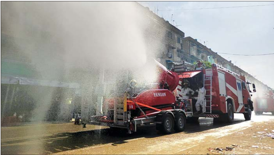
ဇွန် ၆ ရက်က ရန်ကုန်တိုင်းဒေသကြီး သန်လျင်မြို့နယ်အတွင်း ကိုဗစ်-၁၉ ကာကွယ်ဆေးဖျန်းစဉ်။