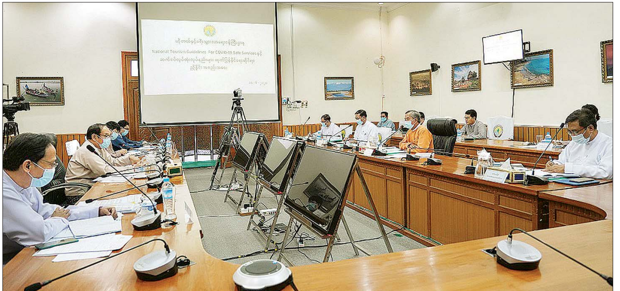
ဟိုတယ်နှင့် ခရီးသွားလာရေးဝန်ကြီးဌာန၏ National Tourism Guidelines for COVID-19 Safe Services နှင့် ဆက်စပ်လုပ်ထုံးလုပ်နည်းများ ထုတ်ပြန်နိုင်ရေးဆိုင်ရာ ညှိနှိုင်းအစည်းအဝေး ကျင်းပစဉ်။

မကြာမီက Forbes Magazine က ကိုဗစ်-၁၉ အလွန်တွင် ပေါ်ထွန်းလာမည့် Tourism Destination ခုနစ်ခုမှာ မြန်မာနိုင်ငံကို ထည့်သွင်းဖော်ပြခဲ့သည့်အတွက် လာမည့် ခရီးသွားရာသီတွင် မြန်မာနိုင်ငံကို လာရောက်လိုသည့် ခရီးသွားများ၏ စုံစမ်းမှုများကို စတင်ရရှိနေပြီ ဖြစ်ပါကြောင်း၊ လက်ရှိလာရောက်သူများမှာ Business or Diplomatic Traveller အများစုဖြစ်ကြပြီး Leisure Traveller