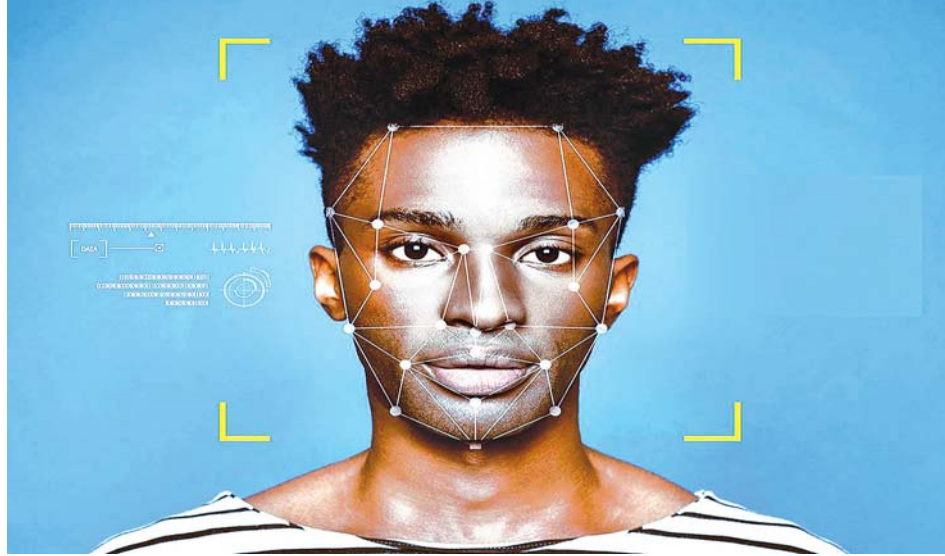
အမေရိကန် နည်းပညာဆော့ဖ်ဝဲဖြင့် မျက်နှာဖတ်၍ စစ်ဆေးမှုတစ်ခုကို တွေ့ရစဉ်။

အမေရိကန်ရဲများ၏ ဖမ်းဆီးမှု အတွင်း အာဖရိကဗွား အမေရိကန် နိုင်ငံသား ကျော့ရှ်ဖျိုး သေဆုံးခဲ့ပြီး နောက် အမေရိကန်ပြည်ထောင်စု တစ်ဝန်း ဆန္ဒပြမှုများ ပေါ်ပေါက်လာ ချိန်တွင် အမေရိကန်ကုမ္ပဏီက ထိုသို့လုပ် ဆောင်လာခဲ့ခြင်းဖြစ်ကြောင်း သိရ သည်။ အေအက်ဖ်ပီ