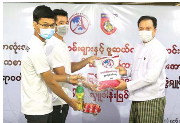
မြန်မာနိုင်ငံဘောလုံးအဖွဲ့ချုပ်ဥက္ကဋ္ဌ ဦးစော်ဇော် တည်ထောင်ထားသည့် ဧရာဝတီဖောင်ဒေးရှင်းအနေဖြင့် ကိုဗစ်-၁၉ ကာကွယ်၊ ကုသရေးလုပ်ငန်းစဉ်များ တွင် တစ်ဖက်တစ်လမ်းမှ ပါဝင်ကူညီဆောင်ရွက်လျက်ရှိပြီး ငွေကြေးနှင့် ဆေးဝါး များ၊ ကုသရေးစက်ပစ္စည်းများ၊ ဆန်နှင့် ထောက်ပံ့ပစ္စည်းများ အခြားလိုအပ်သည့် ကူညီပံ့ပိုးမှုများကို ဆေးရုံများနှင့် အကူအညီလိုအပ်နေသည့် နေရာဒေသ အသီးသီးသို့ လှူဒါန်းမှုများ ပြုလုပ်လျက်ရှိသည်။ ရဲရင့်ရှိုင်း

ထို့ပြင် ဇွန် ၁၁ ရက်က မြန်မာနိုင်ငံဘောလုံးအဖွဲ့ချုပ် မီဒီယာနှင့် သတင်း ဆက်သွယ်ရေးကော်မတီနှင့် ဧရာဝတီဖောင်ဒေးရှင်းတို့ပူးပေါင်း၍ သက်ကြီး အားကစားမီဒီယာနှင့် အားကစားသတင်းထောက် ၁၃၈ ဦးအား ဆန်နှင့် ထောက်ပံ့ငွေများ ပေးအပ်လှူဒါန်းသည်။