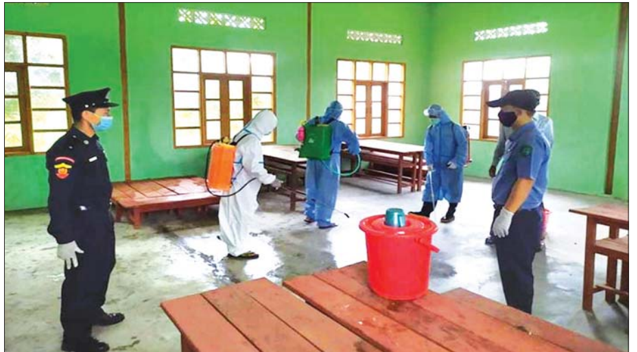
ဇွန် ၆ ရက်က ကချင်ပြည်နယ် မိုးမောက်မြို့နယ် ဒေါ်ဖုန်းယန်မြို့တွင် ကိုဗစ်-၁၉ ကာကွယ်ဆေးဖျန်းစဉ်။