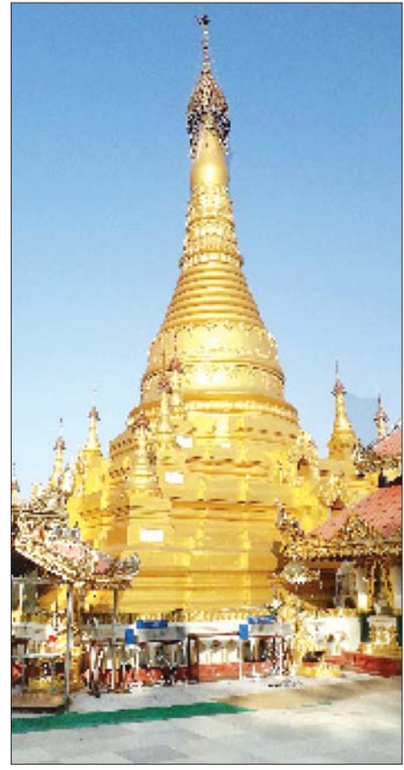
ရွှေလက်လှစေတီ(ရန်အောင်မြင်မြို့ဟောင်း)။

တောင်ငူသမိုင်းတွင် ဆွာချောင်းပေါ်ရှိ ကမ္ဘား မြင့်ရွာကို ပုဂံပြည်ရှင်နရပတိစည်သူမင်းကြီးက သမက် တော် ရန်မာန်ငွေထွေးကို ရွာစားပေးခဲ့သည်။ အနန္တသူရိယ ဘွဲ့ခံ ရန်မာန်ငွေထွေး၏သား မင်းလှစော၊ မင်းလှစော၏ သား သဝန်လက်ျာ လက်ထက်တွင် လူဦးရေများပြား လာသဖြင့် ဆွာချောင်းမြောက်ဘက်ကမ်းသို့ ပြောင်းရွှေ့ကာ ကြခတ်ဝါးရံမြို့ကို တည်ထောင်သည်။ ထိုမြို့စည်ကား လာသည်ကို မွန်ဘုရင်က လာရောက်တိုက်ခိုက်ပြီး မြို့စားသဝန်လက်ျာကို ခေါ်ဆောင်သွားသည်။ ပျူရွာတွင် အကျယ်ချုပ်ချထားသည်။ သဝန်လက်ျာက သားတော်