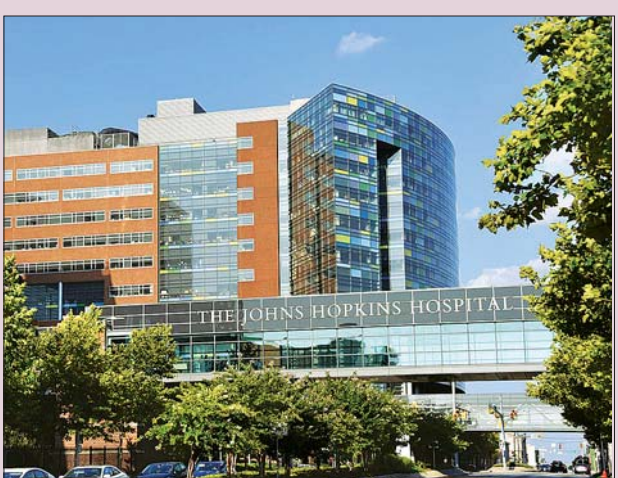
အမေရိကန်နိုင်ငံ မေရီလန်ပြည်နယ် ဘာတီမြို့ရှိ ဂျွန်ဟော့ကင်းဆေးရုံကို တွေ့ရစဉ်။

ဝါရှင်တန် ဇွန် ၁၁ အမေရိကန်ပြည်ထောင်စု၌ ကိုဗစ်- ၁၉ ကူးစက်ဖြစ်ပွားသူ အရေအတွက် သည် ဇွန် ၁၀ ရက်တွင် နှစ်သန်းကျော် အထိ ဖြစ်လာခဲ့ပြီး ဇွန် ၁၁ ရက် ဒေသစံတော်ချိန် နံနက် ၁၁ နာရီခွဲ တွင် စုစုပေါင်း ရောဂါကူးစက်ခဲ့သူ အရေအတွက် ၂၀၀၀၄၆၄ ဦးအထိ ရှိလာကြောင်း ဂျွန်ဟော့ကင်း တက္ကသိုလ်က ဖော်ပြခဲ့သည်။ ရောဂါကူးစက်မှုကြောင့်သေဆုံး သူအရေအတွက်မှာ ၁၁၂၉၂၄ ဦး အထိ မြင့်တက်လာခဲ့ကြောင်း ဂျွန်ဟော့ကင်းတက္ကသိုလ်မှဖော်ပြ သည့် ကိန်းဂဏန်းအချက်အလက် များအရ သိရသည်။ နယူးယောက် ပြည်နယ်တွင် ရောဂါကူးစက်မှု အဆိုးရွားဆုံး