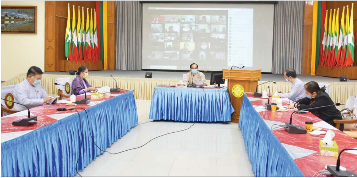
ပြည်ထောင်စုဝန်ကြီး ဒေါက်တာမြင့်ထွေး ကိုဗစ်-၁၉ အန္တရာယ် ဘေးကင်းလုံခြုံစွာ ခွဲစိတ်ကုသမှု (COVID-19 Surgical Safety) ကိစ္စရပ်များအား Video Conferencing ဖြင့် ဆွေးနွေးစဉ်။