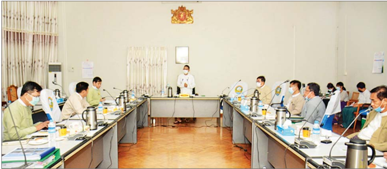
ဦးစီးဌာနများမှ ညွှန်ကြားရေးမှူးချုပ်များက သက်ဆိုင်ရာကဏ္ဍများအလိုက် ကြရာ ပြည်ထောင်စုဝန်ကြီးက လုပ်ငန်းလိုအပ်ချက်များအား ဖြည့်စွက်ဆွေးနွေးအကောင်အထည်ဖော် ဆောင်ရွက်မည့်လုပ်ငန်းစဉ်များအား ရှင်းလင်းတင်ပြ မှာကြားခဲ့ကြောင်း သိရသည်။ သတင်းစဉ်

ထို့နောက် စိုက်ပျိုးရေး၊ မွေးမြူရေးနှင့် ဆည်မြောင်းဝန်ကြီးဌာနအောက်ရှိ