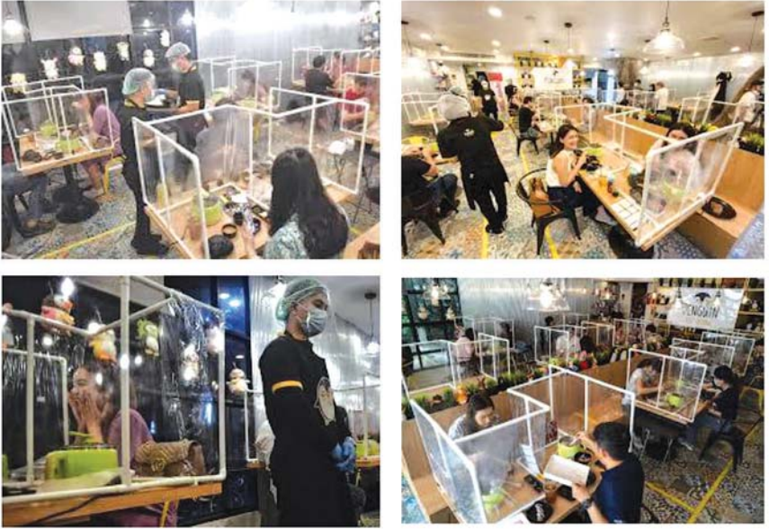
စားသောက်ဆိုင်များတွင် Physical Distancing နမူနာပုံစံများ