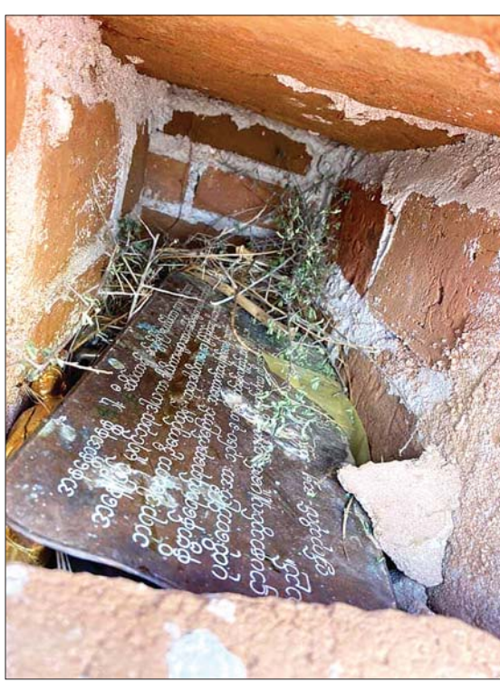
ဖောက်ထွင်းခံရသည့် ဌာပနာတိုက်အတွင်း၌ ကျန်ရှိခဲ့သော အလှူရှင်ကမ္မည်းစာနှင့် ဘုရားဆင်းတုတော်များကို တွေ့ရစဉ်။

ရေးဦးစီးဌာနတို့ကို နှစ်ပတ် တစ်ကြိမ် တင်ပြပါတယ်။ လုံခြုံရေးအတွက် ကင်းလှည့်ရင်းနဲ့ ၁၉၉၅ ခုနှစ်နောက်ပိုင်း တည်ထားတဲ့ ဘုရားတွေအပေါ်ဘက်မှာ အပေါက်လေးတွေကို သတိထားမိတယ်။ ဒီလိုပုံစံမျိုး ဘုရား ၄၊ ၅ ဆူမှာ တွေ့တဲ့အခါ မသင်္ကာလို့ ရှေးဟောင်းသုတေသနဌာနကို အကြောင်းကြားတယ်။ ရှေးဟောင်းသုတေသနဌာနက တာဝန်ရှိသူတွေ လာရောက်ကြည့်ရှုတဲ့အခါမှာ လောလောလတ်လတ် ဖောက်ထားတဲ့ အပေါက်တွေကို တွေ့ရှိပြီး သေချာစစ်ဆေးတဲ့အခါ ဌာပနာဖောက်ခံထားရတာ ဖြစ်နေတယ်” ဟု ပြောသည်။