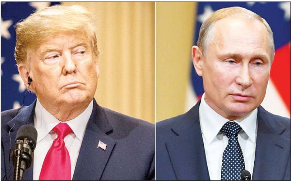
အမေရိကန်သမ္မတ ဒေါ်နယ်ထရမ်နှင့် ရုရှားသမ္မတ ဗလာဒီမာပူတင်တို့ကို တွေ့ရစဉ်။

ထပ်မံမဖြစ်ပွားအောင် တစ်ဦးနှင့်တစ်ဦး သပ်ခွာခွာနေထိုင်ရ တွင် လူထုလှုပ်ရှားမှုများဖြစ်ပွားခဲ့ကြောင်း သိရသည်။ မည့်လမ်းညွှန်ချက်များ ချမှတ်ထားသော်လည်း ဇွန် ၉ ရက် အေအက်ပီပီ