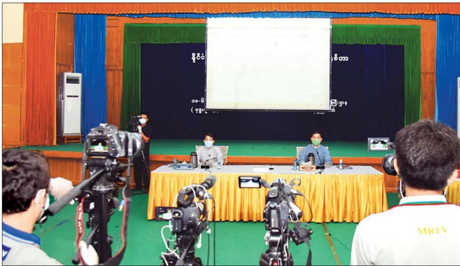
ပြည်သူ့အတွက် စတုတ္ထ (၁)နှစ်တာကာလအတွင်း ဆောင်ရွက်ခဲ့မှုများနှင့် ပတ်သက်သည့် သတင်းစာရှင်းလင်းပွဲ တွင် သာသနာရေးနှင့် ယဉ်ကျေးမှုဝန်ကြီးဌာနမှ ဒုတိယဝန်ကြီး ဦးကြည်မင်းက ရှင်းလင်းပြောကြားစဉ်။ သတင်းစဉ်

ကျိုက်ထီးရိုးစေတီတော်ဂေါပကအဖွဲ့ကို ၂၀၁၆ ခုနှစ် ဩဂုတ် ၂၃ ရက်တွင် အဖွဲ့ဝင် ၁၁ ဦးဖြင့် အသစ်ဖွဲ့စည်းခဲ့ပြီး