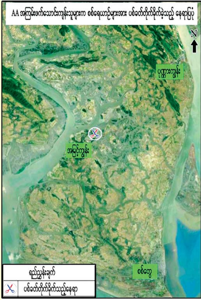
AA အကြမ်းဖက်သောင်းကျန်းသူများက စစ်ရေယာဉ်များအား ပစ်ခတ်တိုက်ခိုက်ခဲ့သည့် နေရာပြပုံ

အဆိုပါဖြစ်စဉ်တွင် စစ်သည်တစ်ဦး ထိခိုက်ဒဏ်ရာရရှိခဲ့ပြီး အဆိုပါ နေရာတစ်ဝိုက်အား လုံခြုံရေးတပ်ဖွဲ့ဝင်များက နယ်မြေစိုးမိုးရေးနှင့် လုံခြုံရေးလုပ်ငန်းများ ဆောင်ရွက်လျက်ရှိကြောင်း၊ အလားတူ ၂၀၁၉ ခုနှစ် စက်တင်ဘာ ၁၅ ရက်တွင်လည်း စစ်တွေမြို့မှ ပလက်ဝမြို့သို့ စစ်သည်၊ မိသားစုများ စားသုံးရန်အတွက် ရိက္ခာပို့ဆောင်ခြင်းနှင့် အုပ်ချုပ်မှုကိစ္စများ ဆောင်ရွက်ရန် ထွက်ခွာလာသည့် တပ်မတော်(ရေ)မှ စစ်ရေယာဉ်များအား ကျောက်တော်မြို့နယ် အပေါက်ကျေးရွာနှင့် တင်းမကျေးရွာတို့အနီးမှ AA အကြမ်းဖက်သောင်းကျန်းသူများက လက်နက်ကြီး/လက်နက်ငယ်များဖြင့် နှောင့်ယှက်ပစ်ခတ်တိုက်ခိုက်ခဲ့ကြောင်း တပ်မတော်သတင်းမှန် ပြန်ကြားရေးအဖွဲ့၏ သတင်းထုတ်ပြန်ချက်တွင် ဖော်ပြထားသည်။