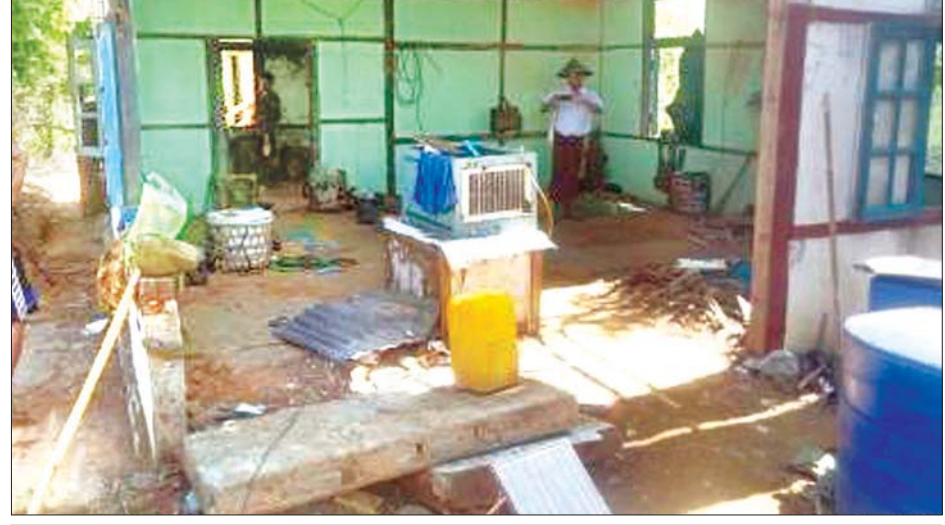
ရုပ်မြင်သံကြား ထပ်ဆင့်လွှင့်စက်ရုံ လွှင့်စက်ခန်း (ပင်မအဆောက်အအုံ) ပျက်စီးနေမှုကို တွေ့ရစဉ်။