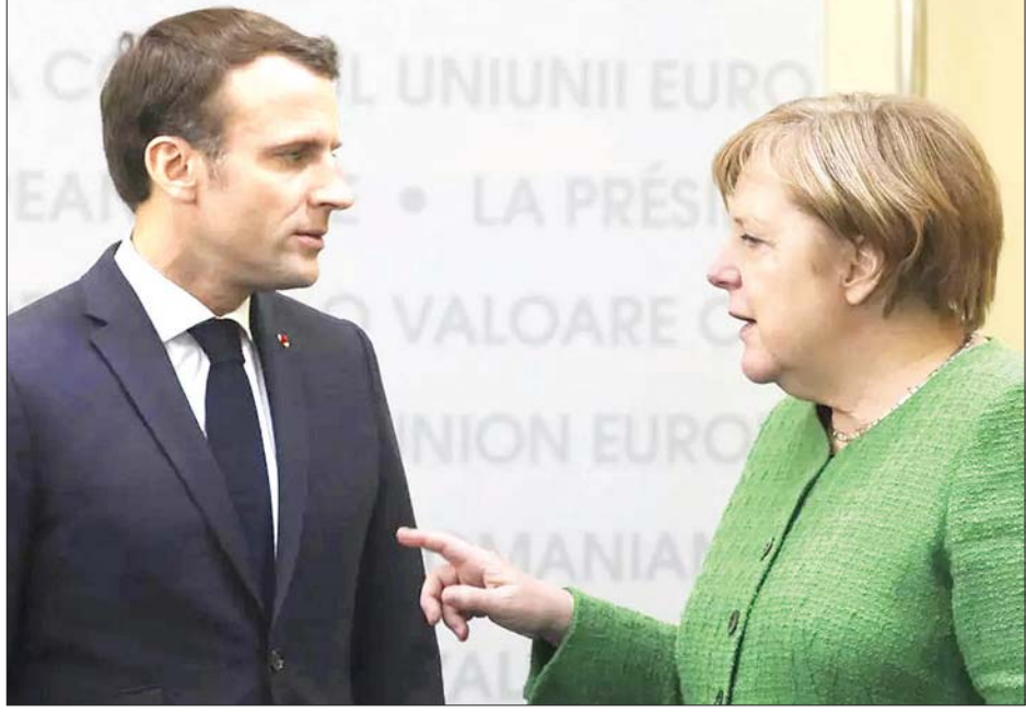
ပြင်သစ်သမ္မတ မက်ခရူန်နှင့် ဂျာမနီဝန်ကြီးချုပ် အန်ဂျလာမာကယ်တို့ကို တွေ့ရစဉ်။