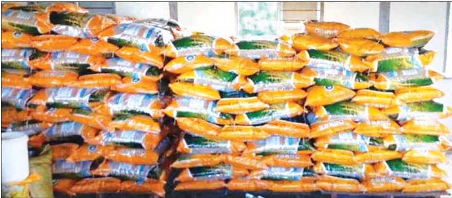
၈၀၀၀ နှုန်းဖြင့် ဖြန့်ဖြူးရောင်းချပေး ဆင်းသုခ မျိုးစပါးများအား ပြင်ပသို့ ပိုး ရင်းနှီးငွေများကို သီးနှံပေါ်ပေး ရောင်းချပေးခြင်းနှင့် သမဝါယမ စနစ်ဖြင့် ဆောင်ရွက်ပေးလျက်ရှိ ကြောင်း သိရသည်။ သတင်းစဉ်

စိုက်ပျိုးရေး၊ မွေးမြူရေးနှင့် ဆည်မြောင်းဝန်ကြီးဌာန၊ သမဝါယမ ဦးစီးဌာန၏ကြီးကြပ်မှုဖြင့် သမဝါယမ အသင်းများမှ မျိုးကောင်းမျိုးသန့်များ ထုတ်လုပ်ခြင်း၊ ဖြန့်ဖြူးရောင်းချခြင်း တို့ကို သမဝါယမနည်းလမ်းများဖြင့် ဆောင်ရွက်ရန်အတွက် မျိုးစေ့ထုတ် သမဝါယမအသင်းများ ဖွဲ့စည်း ဆောင်ရွက်လျက်ရှိရာ ဝေါမြို့နယ် သမဝါယမအသင်းစုမှ အသင်းသားပိုင် လယ်မြေဧက ၁၉၉ ဧကပေါ်တွင် ဆင်းသုခမျိုးစပါး တင်းပေါင်း ၁၅၃၈၈ တင်းကို ထုတ်လုပ်နိုင်ခဲ့ပြီး မျိုးစပါးတစ်တင်းလျှင် ငွေကျပ်