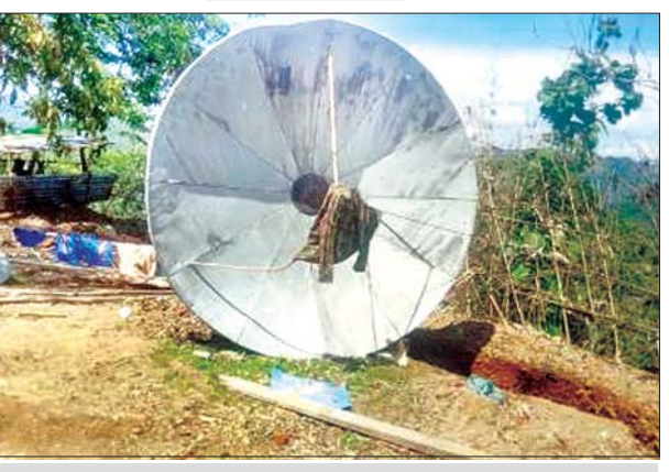
ရုပ်သံဖမ်းယူသည့် စလောင်း (TVRO) ပျက်စီးနေမှုကို တွေ့ရစဉ်။