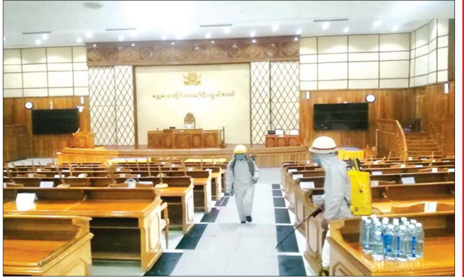
ဇွန် ၅ ရက်က မန္တလေးတိုင်းဒေသကြီး လွှတ်တော်ရုံးအတွင်း ကိုဗစ်-၁၉ ကာကွယ်ဆေးဖျန်းစဉ်။