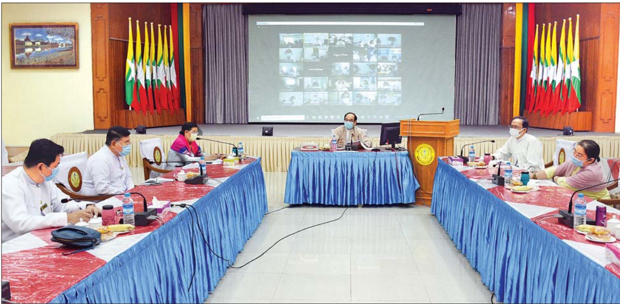
ပြည်ထောင်စုဝန်ကြီး ဒေါက်တာမြင့်ထွေး သူနာပြု/ သားဖွား/ နီးနွယ်သင်တန်းကျောင်း ၅၃ ခုမှ ကျောင်းအုပ်ကြီးများ၊ ကျောင်းအုပ်များ၊ ဆရာ၊ ဆရာမများ နှင့် Video Conferencing စနစ်ဖြင့် ဆွေးနွေးညှိနှိုင်းပွဲတွင် အမှာစကားပြောကြားစဉ်။

ကျောင်းများပြန်ဖွင့်နိုင်ရေး ဆွေးနွေး ယနေ့ အစည်းအဝေးတွင် သူနာပြု/ သားဖွား/ နီးနွယ်သင်တန်း ကျောင်းများကို စနစ်တကျ ပြန်လည် ဖွင့်လှစ်နိုင်ရေး၊ သင်ကြားရေးနှင့်