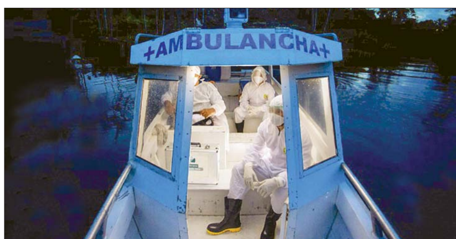
ဘရာဇီးနိုင်ငံ၌ လူနာတင်ရေယာဉ်ပေါ်လိုက်ပါလာသည့် ကျန်းမာရေးဝန်ထမ်းအချို့ကို တွေ့ရစဉ်။

ဘရာဇီးနိုင်ငံတွင် ကျန်းမာရေးဝန်ကြီးဌာနက ကိုဗစ်-၁၉ နေ့စဉ်ကူးစက်ဖြစ်ပွားမှုနှင့် သေဆုံးမှုဆိုင်ရာ စာရင်းအချက်အလက်များ ထုတ်ပြန်မှုကို ပြီးခဲ့သည့် ဇွန် ၇ ရက်တွင် ရပ်ဆိုင်းလိုက်ပြီး ကူးစက်ဖြစ်ပွားမှုနှင့် သေဆုံးမှုများအစား ရောဂါပြန်လည် သက်သာလာသူများစာရင်းကို ထုတ်ပြန်ဖော်ပြခဲ့သည်။