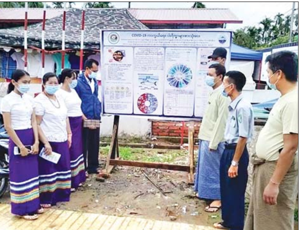
တနင်္သာရီတိုင်းဒေသကြီး သရက်ချောင်းမြို့နယ် ငါးလုပ်ငန်းဦးစီးဌာနမှ ကိုဗစ်-၁၉ ကာကွယ် ထိန်းချုပ်ရေးကာလအတွင်း ငါးစားသုံးခြင်းသည် ကျန်းမာရေး (အထူးသဖြင့် ကိုယ်ခံအားကောင်းမွန်ရေး)အတွက် အကျိုးရှိ ကြောင်း မြို့ဈေးရှေ့တွင် ပို့စတာစိုက်ထူခြင်းကို ဇွန် ၉ ရက်က ဆောင်ရွက် ခဲ့စဉ်။ သတင်းစဉ်