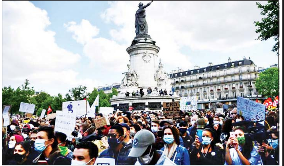
ပါရီမြို့ ဒီလာရီပတ်ဘလစ်ပြည်သူ့ပန်းခြံတွင် ဆန္ဒပြပြည်သူများစုဝေးနေသည့်ကို တွေ့ရစဉ်။

အလားတူ ပြင်သစ်နိုင်ငံတစ်ဝန်းရှိ မြို့များတွင် ဆန္ဒပြသူများ စုဝေးကြကြောင်း သိရသည်။ ကိုရိုနာဗိုင်းရပ်စ်