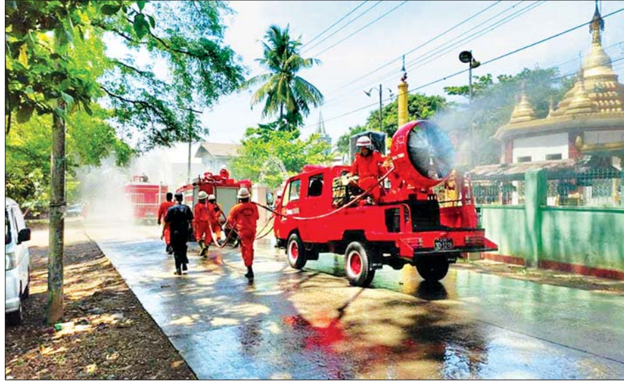
ဇွန် ၄ ရက်က ရန်ကုန်တိုင်းဒေသကြီး၊ အင်းစိန်မြို့နယ်အတွင်း ကိုဗစ်-၁၉ ကာကွယ်ဆေးဖျန်းစဉ်။

သက်ဆိုင်ရာတိုင်းစစ်ဌာနချုပ်အသီးသီးမှ တပ်မတော်သားများ၊ မီးသတ်တပ်ဖွဲ့ဝင်များ၊ ဌာန၊ အဖွဲ့အစည်းများနှင့်ပူးပေါင်း၍ COVID-19 ရောဂါကာကွယ်ထိန်းချုပ်နိုင်ရေးအတွက် ပိုးသတ်ဆေးဖျန်းခြင်းလုပ်ငန်းများကို နေပြည်တော်၊ တိုင်းဒေသကြီး/ပြည်နယ်များမှ မြို့နယ် ၄၃ မြို့နယ်ရှိ နေရာ ၁၄၀ နေရာများ၌ ဇွန် ၄ ရက်နှင့် ၅ ရက်တို့တွင် မီးသတ်ယာဉ်များ၊ မီးသတ်ပစ္စည်းကိရိယာများဖြင့် ဆောင်ရွက်ခဲ့ရာ ပိုးသတ်ဆေးရည် ၇၃ ဂါလန်နှင့် ပိုးသတ်ဆေးမှုန့် ၂၁ ဂရမ်ရရှိသုံးစွဲခဲ့ပြီး ပိုးသတ်ဆေးဖျန်းခြင်းလုပ်ငန်းများကို တာဝန်ရှိသူများက လိုက်လံကြည့်ရှုအားပေးခဲ့ကြောင်း သိရသည်။