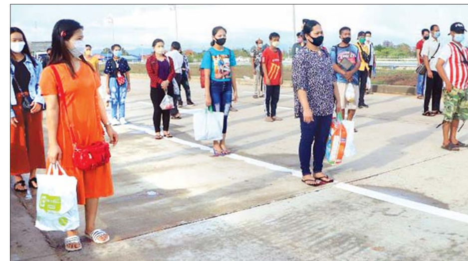
မြဝတီ အမှတ်(၂) ချစ်ကြည်ရေးတံတားမှတစ်ဆင့် ပြန်လည်ဝင်ရောက်လာသည့် မြန်မာနိုင်ငံသားများကို တွေ့ရစဉ်။

မြဝတီ ဇွန် ၁၀ ထိုင်းနိုင်ငံမှ မြန်မာရွှေ့ပြောင်းလုပ်သား ၉၉၄ ဦးသည် ယနေ့တွင် မြဝတီအမှတ်(၂) ချစ်ကြည်ရေးတံတားမှတစ်ဆင့် ပြန်လည်ဝင်ရောက်လာခဲ့ကြောင်း သိရသည်။ ထိုသို့ ပြန်လည်ဝင်ရောက်လာသူများအနက် ၁၂၅ ဦးသည် ထိုင်းနိုင်ငံဆိုင်ရာ မြန်မာသံရုံး၏ စီစဉ်ဆောင်ရွက်ပေးမှုဖြင့် ထိုင်းနိုင်ငံ မော်ချစ်ကားဂိတ်မှ ကားခြောက်စီးဖြင့် ပြန်လည်ဝင်ရောက်လာသူများဖြစ်ပြီး ကျန် ၈၆၉ ဦးသည် ထိုင်းနိုင်ငံ ဒေသအသီးသီးမှ ၎င်းတို့၏ အစီအစဉ်ဖြင့် ပြန်လည်ဝင်ရောက်သူများဖြစ်ကြောင်း သိရသည်။ စာမျက်နှာ ၁၇ ကော်လံ ၁ ❖