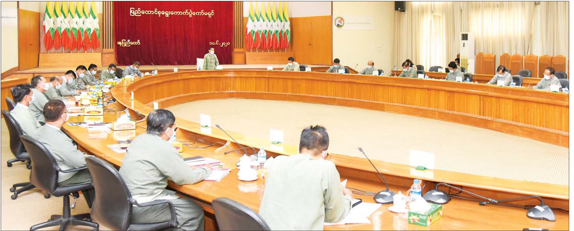
ပြည်ထောင်စုရွေးကောက်ပွဲကော်မရှင်ဥက္ကဋ္ဌ ဦးလှသိန်း ၂၀၂၀ ပြည့်နှစ် အထွေထွေရွေးကောက်ပွဲကို ကိုဗစ်-၁၉ ရောဂါ ကြိုတင်ကာကွယ်ရေးနည်းလမ်းများနှင့်အညီ ကျင်းပပြုလုပ်နိုင်ရေး အကြံပြုညှိနှိုင်းအစည်းအဝေးတွင် အမှုစကားပြောကြားစဉ်။

နေပြည်တော် ဇွန် ၁၀ ၂၀၂၀ ပြည့်နှစ် အထွေထွေရွေးကောက်ပွဲကို ကိုဗစ်-၁၉ ရောဂါ ကြိုတင်ကာကွယ်ရေးနည်းလမ်းများနှင့်အညီ ကျင်းပနိုင်ရေး အကြံပြုညှိနှိုင်းအစည်းအဝေးကို ယနေ့နံနက် ၁၀ နာရီတွင် နေပြည်တော်ရှိ ပြည်ထောင်စုရွေးကောက်ပွဲ