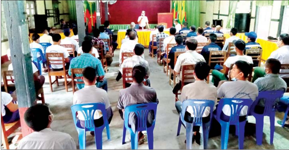
ညောင်လေးပင်မြို့၌ အသွားအလာကန့်သတ်စင်တာများတွင် လုပ်အားပေးမည့် စေတနာ့ဝန်ထမ်းများအား သင်တန်းပို့ချစဉ်။