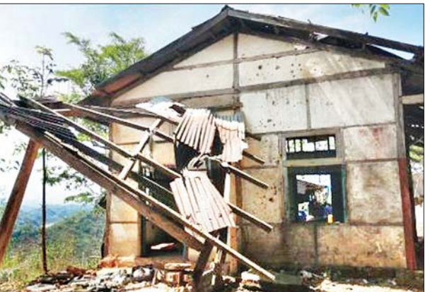
ရုပ်မြင်သံကြား ထပ်ဆင့်လွှင့်စက်ရုံ ပင်မအဆောက်အအုံ စတုဂံခန်း ပျက်စီး နေမှုကို တွေ့ရစဉ်။