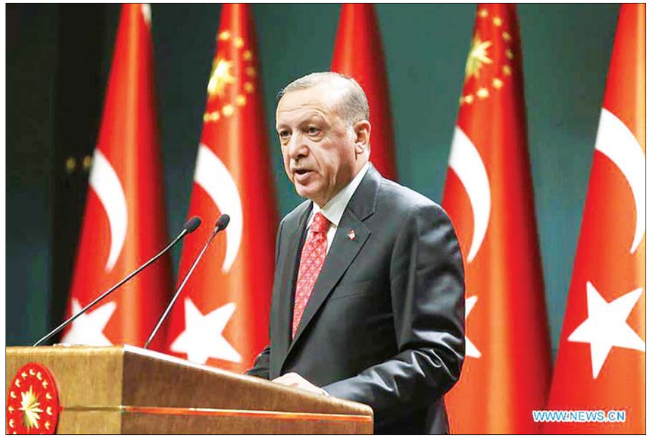
တူရကီသမ္မတ ရီဆက်တေယစ်အာဒိုဂန်

ရုရှားသည် လစ်ဗျားစစ်အာဏာရှင် ကာလီဖာနီယာတို့ကို အကူအညီ ပေးရန် ရုရှားနိုင်ငံ၏ ပုဂ္ဂလိက လုံခြုံရေးကုမ္ပဏီ Wagner မှ ကြေးစားစစ်သား ထောင်ချီပို့ပေးခဲ့ကြောင်း စွပ်စွဲခံထားရပြီး ကရင်မလင်နန်းတော်က စွပ်စွဲချက်ကို ငြင်းဆန်ထားသည်။ အေအက်ဖီပီ