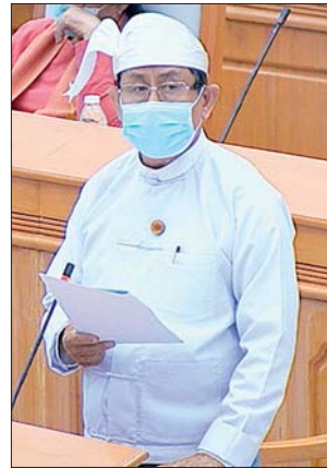
ဒုတိယဝန်ကြီး ဦးမောင်မောင်ဝင်း

ဆက်လက်၍ ပြည်ထောင်စုလွှတ်တော်ဒုတိယဥက္ကဋ္ဌက နိုင်ငံတော်သမ္မတထံမှ ပေးပို့ထားသော အငွေအကျော့ အာဆီယံငွေကြေးရေးဝန်ဆောင်မှုလုပ်ငန်းများ ဖြေလျှော့ပေးရေး သဘောတူညီချက် အသက်ဝင်ရေး အတည်ပြုစာချုပ်လွှာတွင် မြန်မာနိုင်ငံမှ ပါဝင်လက်မှတ်ရေးထိုးနိုင်ရေးနှင့် စပ်လျဉ်း၍ လွှတ်တော်၏ အဆုံးအဖြတ် ရယူအတည်ပြုသည်။