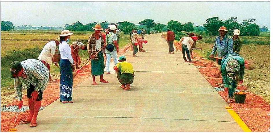
ခရမ်းမြို့နယ် အုန်းပင်-ကင်မွန်းခြံ ကျေးလက်မြေသားလမ်းကို ကျေးလက်လမ်းဦးစီးက ကွန်ကရစ်ခင်းနေ ဆောင်ရွက်ပေးစဉ်။

အဆိုပါ အုန်းပင် - ကင်မွန်းခြံ ကျေးလက်လမ်းသည် လွန်ခဲ့သော ၂၅ နှစ်က ရေငန်တား ဆည်မြောင်းတာ