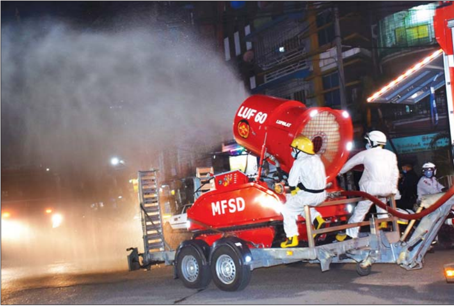
မေ ၂၃ ရက်က ရန်ကုန်တိုင်းဒေသကြီး ဒဂုံမြို့သစ်(တောင်ပိုင်း)မြို့နယ်အတွင်း COVID-19 ကာကွယ်ဆေးဖျန်းခြင်း ဆောင်ရွက်စဉ်။