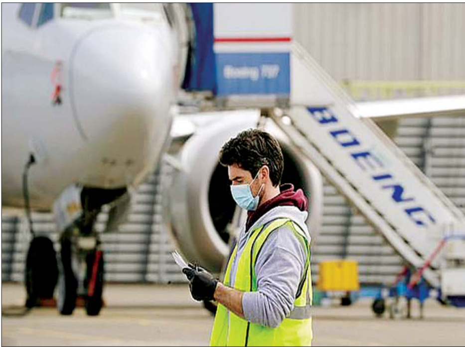
ဘိုးရင်းကုမ္ပဏီမှ ဝန်ထမ်းတစ်ဦးကို တွေ့ရစဉ်။

မလွဲသာတဲ့အခြေအနေ တခြားဖြေရှင်းနိုင်မယ့် နည်းလမ်းရှာတွေ့ဖို့ မျှော်လင့်ခဲ့ပေမယ့်လည်း ဘယ်လိုမှအဆင်မပြေတော့ တဲ့အတွက် မလွဲသာတဲ့အခြေအနေတွေအရ ဝန်ထမ်းတွေ ကိုလျှော့ချဖို့အချိန် ရောက်လာရတယ်လို့ ကုမ္ပဏီရဲ့ စီအီးအိုကယ်လ်ဟွန်းက မေ ၂၇ ရက်က ဝန်ထမ်းတွေကို အကြောင်းကြားတဲ့ ထုတ်ပြန်ချက်တစ်စောင်မှာ ဆိုထား ပါတယ်။