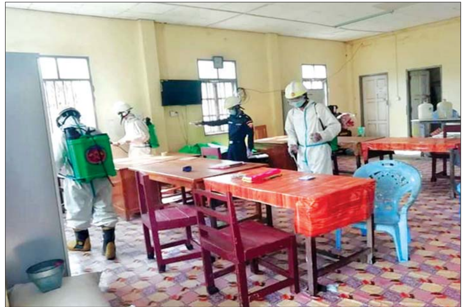
မေ ၂၃ ရက်က ရခိုင်ပြည်နယ် မောင်တောမြို့ ဘေးအန္တရာယ်ဆိုင်ရာစီမံခန့်ခွဲမှုဦးစီးဌာနတွင် COVID-19 ကာကွယ်ဆေးဖျန်းခြင်း ဆောင်ရွက်စဉ်။