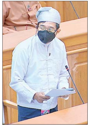
မြန်မာနိုင်ငံတော်ဗဟိုဘဏ် ဒုတိယဥက္ကဋ္ဌ ဦးဘိုဘိုထွန်း

နိုင်ငံ/အဖွဲ့အစည်း၏ မိမိတို့နိုင်ငံအပေါ် ထားရှိသည့် မူဝါဒ၊ မိမိတို့နိုင်ငံနှင့် ဆက်ဆံရေး၊ မိမိတို့နိုင်ငံ၏ လက်ရှိလုပ်ကိုင်ဆောင်ရွက်နေမှုနှင့် မိမိတို့နိုင်ငံ၏ ရှေ့အလားအလာ စသည်တို့ကို အဘက်ဘက်မှ ကြည့်ရှုပြီးမှသာ ပေးအပ်လေ့ရှိပါကြောင်း။