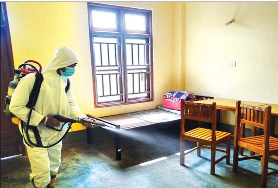
မေ ၂၃ ရက်က ချင်းပြည်နယ် ဟားခါးမြို့ပေါ်ရပ်ကွက်ရှိ နယ်စပ်ဒေသတိုင်းရင်းသားလူငယ်များ ဖွံ့ဖြိုးရေး သင်တန်းကျောင်းတွင် COVID-19 ကာကွယ်ဆေးဖျန်းခြင်း ဆောင်ရွက်စဉ်။