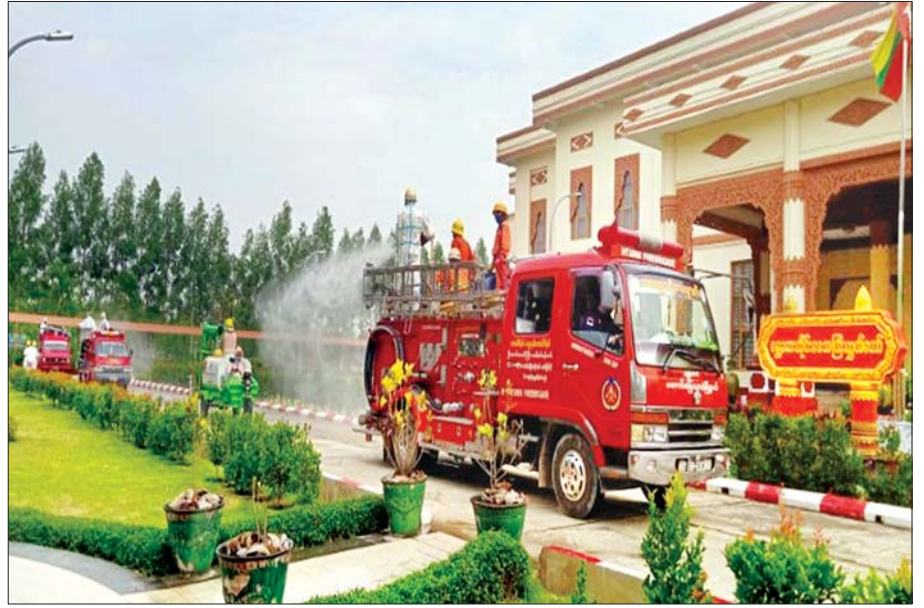
မေ ၂၃ ရက်က မန္တလေးတိုင်းဒေသကြီး လွှတ်တော်အတွင်း COVID-19 ကာကွယ်ဆေးဖျန်းခြင်း ဆောင်ရွက် စဉ်။