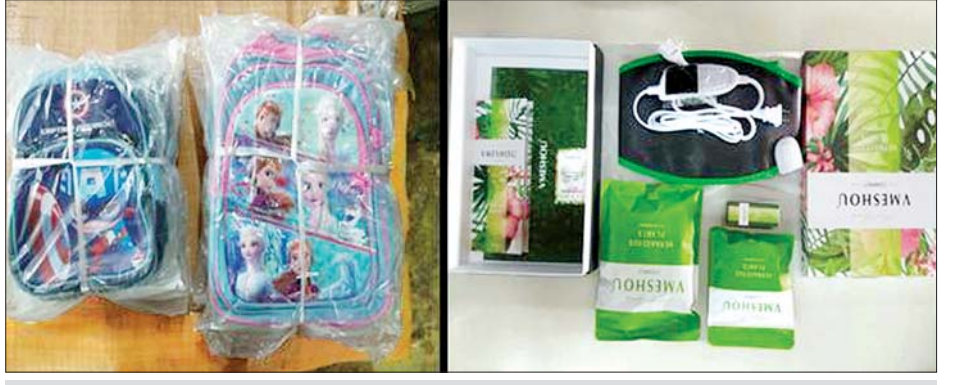
တရားမဝင် စာရွက်စာတမ်းအထောက်အထား တင်ပြနိုင်ခြင်းမရှိသည့် ကျော့ပိုးအိတ်(အကြီး)၊ ကျော့ပိုးအိတ်(အသေး) နှင့် အဆီကျဆေးခါးပတ်။

သွင်းကုန် ၄၁၅ စီး၊ ရန်ကုန်-မြဝတီ လမ်းမကြီးတစ်လျှောက် ကုန်သွယ် မှုယာဉ် သွင်းကုန် ၁၉၈ စီး၊ ကုန်စည် များ သယ်ယူပို့ဆောင်လျက်ရှိသည်။