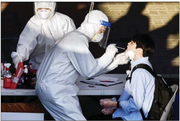
မေ ၂၇ ရက်က ဆိုးလ်မြို့တောင်ပိုင်း ဘူချန် ကိုဗစ်-၁၉ စမ်းသပ်စစ်ဆေးမှု ဌာနတွင် ကျန်းမာရေးဝန်ထမ်းတစ်ဦးက အာခေါင်တို့ဖတ်နမူနာယူနေစဉ်။

သော ကျန်းမာရေး ဆောင်ရွက်ချက် များ ပြန်လည်စတင်ရန် တိုက်တွန်း လိုက်သည်။ မိမိတို့အနေဖြင့် အသွားအလာ ကန့်သတ်စောင့်ကြည့်မှုဆောင်ရွက် ချက်များအပါအဝင် ကိုဗစ်-၁၉ ကူးစက်ပြန့်ပွားမှုမရှိစေရန် ဖြစ်နိုင် သည့် နည်းလမ်းများ အားလုံးကို မြို့တော်ဒေသတွင် မေ ၂၉ ရက်မှစပြီး ဇွန် ၁၄ ရက်အထိ ကျင့်သုံးသွားမည် ဖြစ်ကြောင်း ကျန်းမာရေးဝန်ကြီးက ပြောကြားလိုက်သည်။ နိုင်ငံသားများကိုလည်း လူစု လူဝေးမလုပ်ကြရန် သို့မဟုတ် စားသောက်ဆိုင်များ၊ အရက်ဆိုင်များ အပါအဝင် လူစုလူဝေးနေရာများသို့ သွားလာခြင်းမပြုဘဲ ရှောင်ကြဉ်ရန် အကြံပြုတိုက်တွန်းထားသည်။ ထို့အတူ ဘာသာရေးဆိုင်ရာ ဆောင်ရွက်ချက်များကိုလည်း အသွား အလာကန့်သတ်ဆောင်ရွက်ချက်များ ဖြင့် သတိစိရိယာဖြင့် လုပ်ဆောင်ကြရန် တိုက်တွန်းလိုက်ကြောင်း သိရသည်။ အေအက်ဖ်ပီ