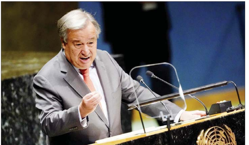
ကုလသမဂ္ဂအထွေထွေအတွင်းရေးမှူးချုပ် အန်တိုနီယို ဂူတာရက်စ်။