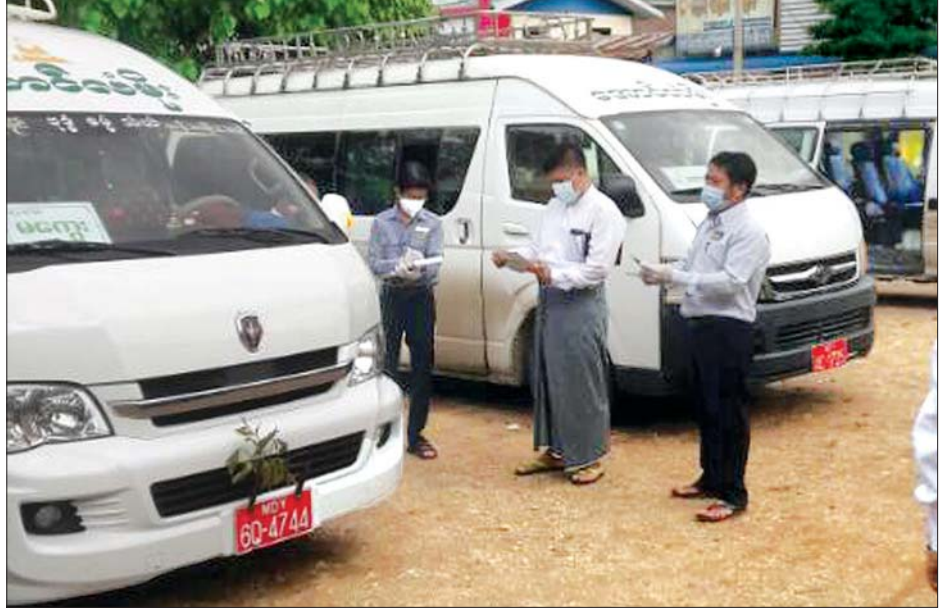
ပူးပေါင်းအဖွဲ့များက ယာဉ်များမထွက်ခွာမီ စည်းကမ်းလိုက်နာမှုရှိ၊ မရှိစစ်ဆေးကြစဉ်။

BHG Inc သည် တစ်ကမ္ဘာလုံးဆိုင်ရာကျန်းမာရေး၊ သက်ကြီးစောင့်ရှောက် ရေး၊ အစားအသောက်၊ ဟိုတယ်ခရီး၊ အိမ်ရာဆောက်လုပ်ရေးလုပ်ငန်း၊ လယ်ယာ လုပ်ငန်းများတွင် ဦးဆောင်ပြုပြင်ပြောင်းလဲမှုများ ပြုလုပ်နေသောလုပ်ငန်း အုပ်စုဖြစ်သည်။ ယင်းနှင့်ဆက်စပ်လုပ်ငန်းများတွင် အမေရိကန် ဒေါ်လာသန်း ၂၅၀ ကျော်တန်ဖိုးရှိ ဆန်းသစ်တီထွင်မှုများ ဆောင်ရွက်လျက်ရှိကြောင်း သိရ သည်။ ဟိန်းထက်ဇော်(မြန်မာ့အလင်း)