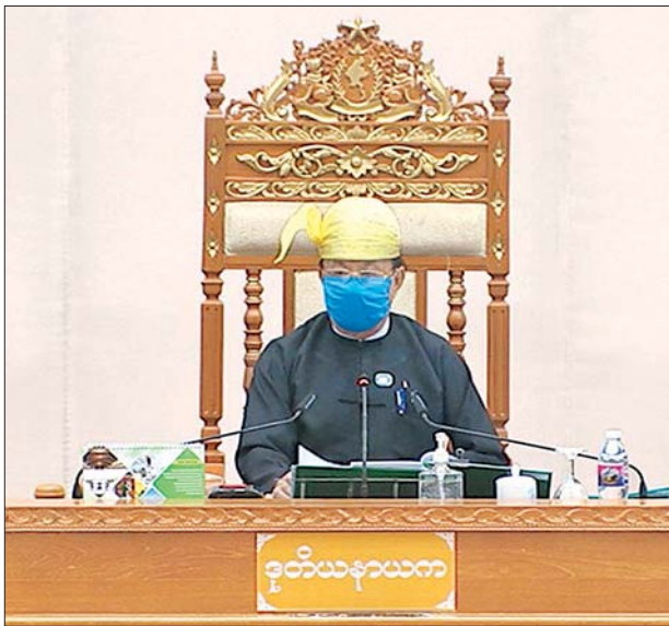
ပြည်ထောင်စုလွှတ်တော် ဒုတိယဥက္ကဋ္ဌ ဦးထွန်းအောင် (ခ) ဦးထွန်းထွန်းဟိန်

နိုင်ငံတော်အနေဖြင့် Project Loan များ ရယူလျက်ရှိသကဲ့သို့ အရေးပေါ်ကာလအတွင်း သင့်လျော်သော Program Loan များကိုလည်း ရယူသင့်ပါကြောင်း၊ ပြည်ပချေးငွေ အထူးသဖြင့် သက်သာမှုရှိသော ချေးငွေများ ရယူရာတွင် မိမိတို့ရယူလိုတိုင်း ရယူနိုင်သည် မဟုတ်ပါကြောင်း၊ ချေးငွေပေးအပ်မည့်