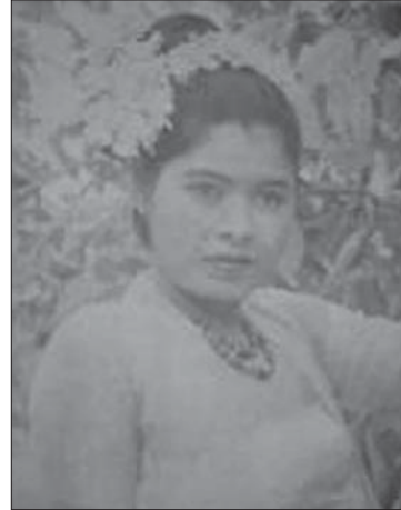
မြင့်မြင့်ခင်

တစ်ခါတည်းသွင်းရတာ၊ Playback မရိုက်ဘူး။ ကြည်စိုးထွန်း ။ ။ Single System ဆိုတော့ အသံ ရော၊ အရုပ်ရော တစ်ခါတည်း။ အဝမ်းကြည်အေး ။ ။ အသံရော၊ အရုပ် ရော တစ်ခါတည်း ပြီးတာနဲ့ ဖြတ်ထည့်ရင်ရတယ်။ ကြည်စိုးထွန်း ။ ။ အဲဒီတော့နောက်မှ ပိုးလို့မရဘူး။ အဝမ်းကြည်အေး ။ ။ မရဘူး။ ကြည်စိုးထွန်း ။ ။ မရတော့ တစ်ခါ တည်း ဥပမာဆိုပါ