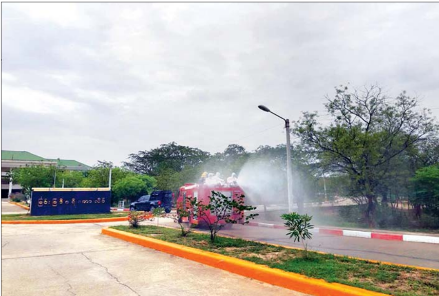
မေ ၂၃ ရက်က မန္တလေးတိုင်းဒေသကြီး မြင်းခြံခရိုင်ကောလိပ်တွင် COVID-19 ကာကွယ်ဆေးဖျန်းခြင်း ဆောင်ရွက်စဉ်။