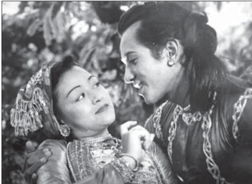
ကျော်ဆွေ၊ မေမြ