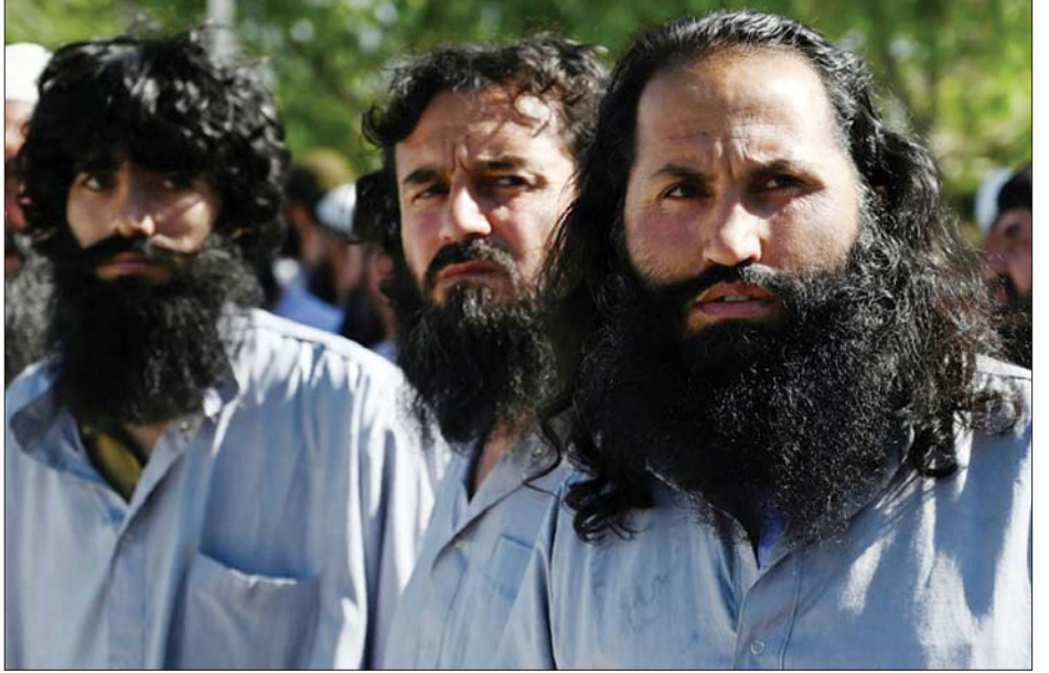
တာလီဘန်အဖွဲ့က အပစ်အခတ်ရပ်စဲကြောင်း ကြေညာခဲ့ပြီးနောက် အာဖဂန်အစိုးရက ပြန်လွှတ်ပေးလိုက်သည့် တာလီဘန်အကျဉ်းသားအချို့ကို တွေ့ရစဉ်။