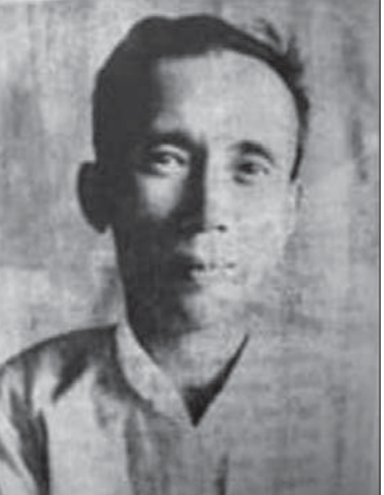
ဆရာ မြို့မြို့မင်း

အဝမ်းကြည်အေး ။ ။ ဟုတ်တယ်၊ အခု ဒေါ်မေလွင်ရယ်၊ သူ့သမီးလေးရယ် နေတယ်။ ကြည်စိုးထွန်း ။ ။ ဟုတ်ကဲ့ ဟုတ်ကဲ့။ အဝမ်းကြည်အေး ။ ။ အဲဒီမှာ မှတ်ရ တယ်။ မှတ်ပြီး တော့မှ အဲဒါကို ပြန်ပြီးတော့လုပ်တော့ သီချင်းတစ်ပိုဒ်ပြီးသွားပြီ။ ပြီးပြီးတော့ ဆရာ မန္တလေး ပြန်သွားပြီးတော့ လေယာဉ်ပျံကွင်း လမ်းမှာ ကားကြိတ်ခံလိုက်တာ။ ကြည်စိုးထွန်း ။ ။ ဩဂုတ်၊ ဟုတ်ကဲ့ ဟုတ်ကဲ့။ အဝမ်းကြည်အေး ။ ။ ဒီမှာ ကတည်း က ပြောပြောနေ တယ်၊ ဆရာက ငါ့ခေါင်းကြီး မကောင်းဘူးကွ တဲ့၊ သေသွားချင်တယ်တဲ့။ ကြည်စိုးထွန်း ။ ။ ဩဂုတ်၊ ဖြစ်မှဖြစ်ရ လေ။ အဝမ်းကြည်အေး ။ ။ ကားကြိတ်ခံလိုက် တော့ ပွဲချင်းပြီးပဲ။ ကြည်စိုးထွန်း ။ ။ ဦးလေးနဲ့ ဆရာ မြို့မြို့မပြီးက လက် ပွန်းတတီး နေလိုက်ရသေးတာပေါ့။ အဝမ်းကြည်အေး ။ ။ ကျွန်တော် တစ်လ လောက် နေခဲ့ရ တယ်။ ကြည်စိုးထွန်း ။ ။ ကျေးဇူးအများကြီး ကြီးတာပဲ။ အဝမ်းကြည်အေး ။ ။ ဟာ၊ ကျွန်တော့် ဆရာ၊ ဆရာ ကောင်းတွေအများကြီး တွေပါတယ်။ ကြည်စိုးထွန်း ။ ။ အဲဒါလည်း ကျွန် တော်က တစ်ချက်