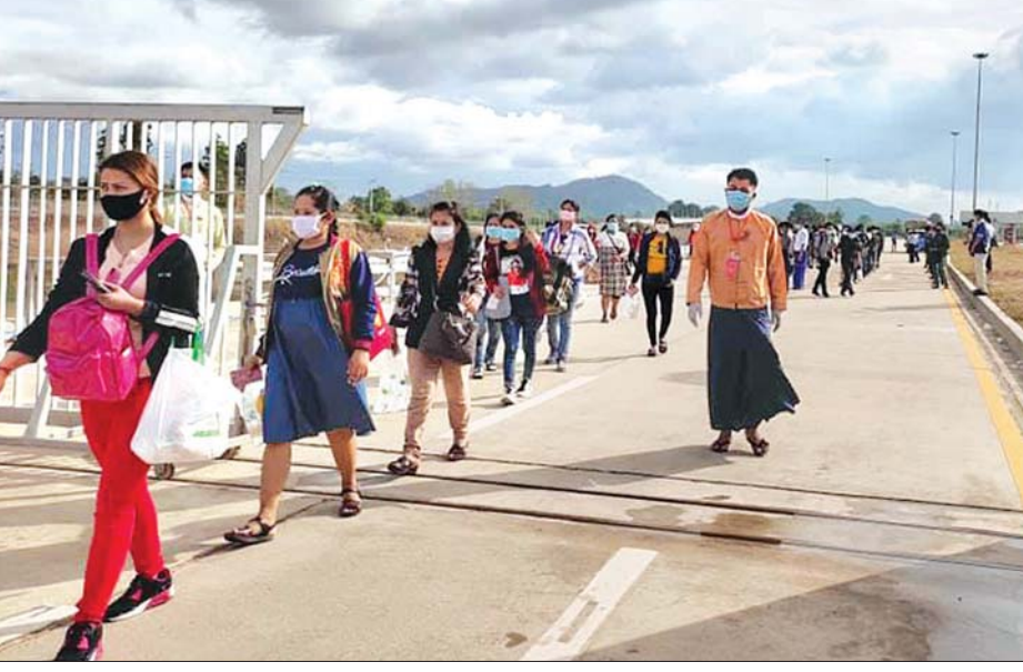
ထိုင်းနိုင်ငံမှ ပြန်လည်ဝင်ရောက်လာသည့် မြန်မာနိုင်ငံသားများကို တွေ့ရစဉ်။

ထိုသို့ ပြန်လည်ဝင်ရောက်လာသူများအနက် ၅၀၃ ဦး သည် ဖော်တော်ယာဉ် ၂၄ စီးဖြင့် နှစ်နိုင်ငံအစိုးရ၏ ညှိနှိုင်းမှု ထိုင်းနိုင်ငံဆိုင်ရာ မြန်မာသံရုံး၏ အစီအစဉ်ဖြင့် ပြန်လည် ဝင်ရောက်သူများဖြစ်ပြီး ကျန် ၆၆၅ ဦးသည် ထိုင်းနိုင်ငံ ဒေသအသီးသီးမှ ငှက်တို့၏ အစီအစဉ်ဖြင့် ပြန်လည် ဝင်ရောက်သူများဖြစ်ကြောင်း သိရသည်။