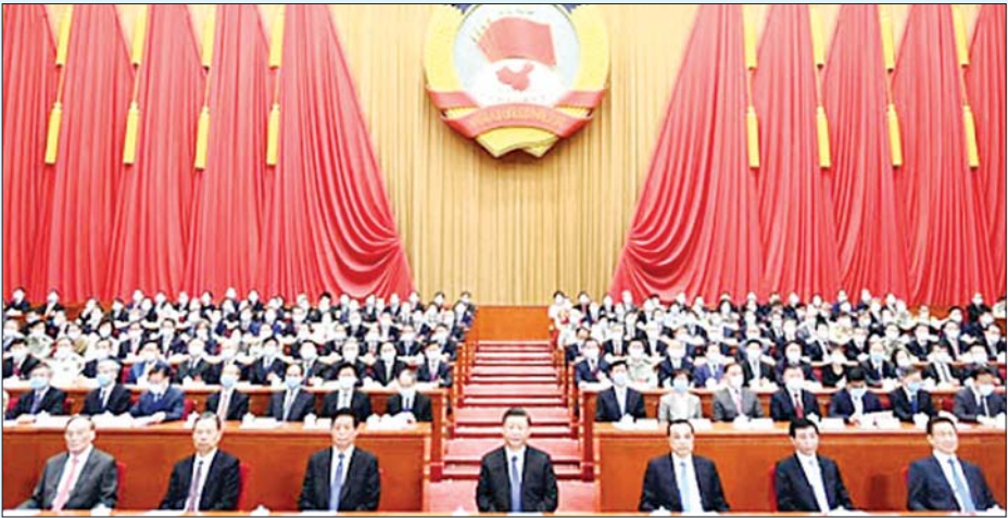
ပေကျင်းမြို့တွင် (၁၃) ကြိမ်မြောက် အမျိုးသားပြည်သူ့ကွန်ဂရက် တတိယအကြိမ်မြောက်အစည်းအဝေး ပိတ်ပွဲ အခမ်းအနား ကျင်းပစဉ်။

လူမှုရေးဖွံ့ဖြိုးတိုးတက်မှုစီမံကိန်းများ အပြင် ဗဟိုနှင့်ဒေသဆိုင်ရာ ဘတ်ဂျက် ဆိုင်ရာ ဆုံးဖြတ်ချက်များကိုလည်း အတည်ပြုခဲ့ကြောင်း သိရသည်။ ဆင်ဟွာ