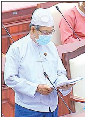
ဒုတိယရွှေ့နေချုပ် ဦးဝင်းမြင့်

ဒဂုံမဲဆန္ဒနယ်မှ ဒေါက်တာသက်သက်ခိုင်၏ ယခုပြင်ဆင်ထားသည့်ထက် ပိုမိုထိရောက်သော စီမံခန့်ခွဲမှုများ နိုင်ငံအနှံ့မှာ အရေးပေါ်ပြင်ဆင်နိုင်ရန်နှင့် COVID-19 ဘေးအန္တရာယ်ကျရောက်လာသည့်အခါ တိုင်းဒေသကြီးနှင့်ပြည်နယ် အစိုးရထံသို့ လုံလောက်သော ဘဏ္ဍာငွေများ ဖြည့်ဆည်းပေးရန်နှင့် ထိုသို့ ဆောင်ရွက်နိုင်ရန် COVID-19 ကနဦး ရန်ပုံငွေကျပ်ဘီလီယံ ၁၀၀ အပြင် ပြည်ထောင်စုဘဏ္ဍာငွေအရင်းနှီးငွေဥပဒေမူကြမ်းတင်သွင်းခြင်းဆိုင်ရာ ဥပဒေ ပုဒ်မ ၁၀၃၊ ပုဒ်မ ၈၅ (ဂ) အရ ပြည်ထောင်စုလွှတ်တော်က လက်ရှိဘဏ္ဍာရေးနှစ် အတွင်း နောက်ထပ်အရေးပေါ်ရန်ပုံငွေ သုံးစွဲခွင့်ပြုရန် အစီအစဉ်ရှိ၊ မရှိတို့ကို သိရှိလိုခြင်း မေးခွန်းနှင့်စပ်လျဉ်း၍ စီမံကိန်း၊ ဘဏ္ဍာရေးနှင့် စက်မှုဝန်ကြီးဌာန ဒုတိယဝန်ကြီး ဦးမောင်မောင်ဝင်းက ၂၀၁၉-၂၀၂၀ ဘဏ္ဍာရေးနှစ် ပြည်ထောင်စု ၏ နောက်ထပ် ဘဏ္ဍာငွေခွဲဝေသုံးစွဲရေးဥပဒေကြမ်းကို ပြည်ထောင်စုလွှတ်တော်