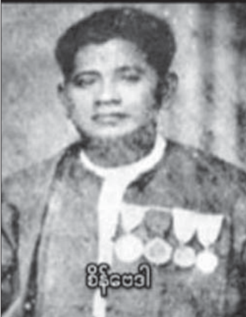
စိန်ဗေဒါ

ဂစ်တာလေးနဲ့ ကျွန်တော်က လိုက်တီးပေးရ တယ်။ ဒါရိုက်တိုး...။ ကြည်စိုးထွန်း ။ ။ ဟုတ်ကဲ့ ဟုတ်ကဲ့။ အဝမ်းကြည်အေး ။ ။ ချစ်မုန်းမာနံထဲမှာ ဆို မေသစ်ဆိုတဲ့၊ ကြည်+အဝမ်း ။ ။ “ချစ်ပင်ပျိုး လို့ ချစ်မိုးတွေ စွေစွေ၊ ချစ်စေစင် ပက်ကာဖျန်း၊ ချစ်ပန်းပွင့်ကာနေ၊ မေတ္တာတွေ အသင်္ချာအသေခံချေ ဘယ်လို ပြောင်းသော်လည်း မမုန်းနိုင်ဘူး ချစ်သူ ရေ...” ကြည်စိုးထွန်း ။ ။ ဟား ဟား ဟား ၊ ဦးလေး ရသေး