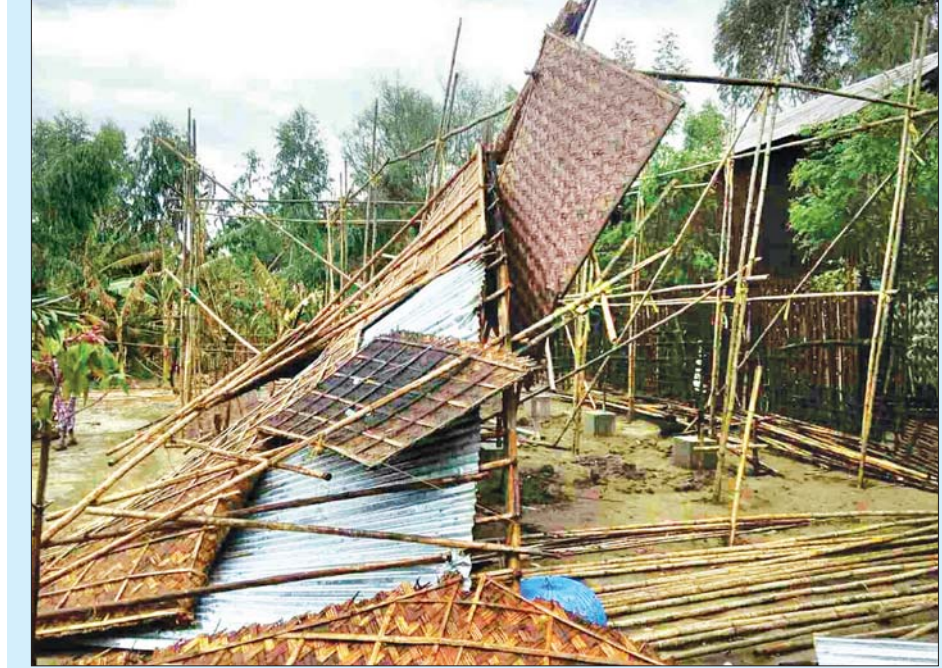
မင်းဘူး(စက)မြို့နယ်၌ အမိုးလန်ပျက်စီးသွားသည့် နေအိမ်ကို တွေ့ရစဉ်။