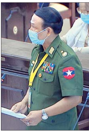
ဒုတိယဝန်ကြီး ဗိုလ်ချုပ် စိုးတင်နိုင်

ချင်းပြည်နယ် မဲဆန္ဒနယ်အမှတ်(၃)မှ ဦးဘွဲ့ခိန်း ၏ ချင်းပြည်နယ် ထန်တလန် မြို့နယ် ဇေယျာ (ခ) အခြေခံပညာအလယ်တန်းကျောင်း အဆောင်(၁) သည် လိုယွင်းပျက်စီးနေပါသဖြင့် ၂၀၂၀ - ၂၀၂၁ ဘဏ္ဍာရေးနှစ်တွင် RCC နှစ်ထပ်ဆောင် ဆောက်လုပ်ပေးရန် အစီအစဉ် ရှိ/မရှိ မေးခွန်းနှင့်စပ်လျဉ်း၍ ပညာရေးဝန်ကြီးဌာန ပြည်ထောင်စုဝန်ကြီး ဒေါက်တာမျိုးသိမ်းကြီး က ဇေယျာ(ခ) အခြေခံပညာအလယ်တန်းကျောင်းတွင်ရှိသည့် အန္တရာယ်ရှိ ကျောင်းဆောင် ပေ(၁၂၀ x ၃၀) သွပ်မိုးပျဉ်ကာကို ဖျက်သိမ်း၍ ပေ(၁၂၀ x ၃၀) RC နှစ်ထပ်ဆောင် တစ်ဆောင် ဆောက်လုပ်ပေးရန်အတွက် လိုအပ်သည့်ရန်ပုံငွေကို ၂၀၂၀ - ၂၀၂၁ ဘဏ္ဍာရေးနှစ် ငွေလုံးငွေရင်းတည်ဆောက်ရေးရန်ပုံငွေ ခေါင်းစဉ်အောက်မှ