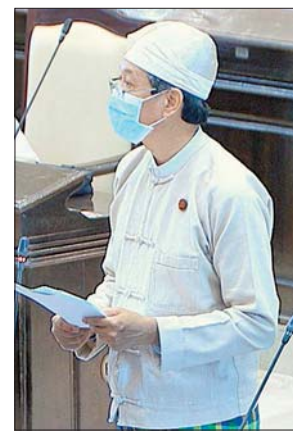
ပြည်ထောင်စုဝန်ကြီး ဒေါက်တာမျိုးသိမ်းကြီး