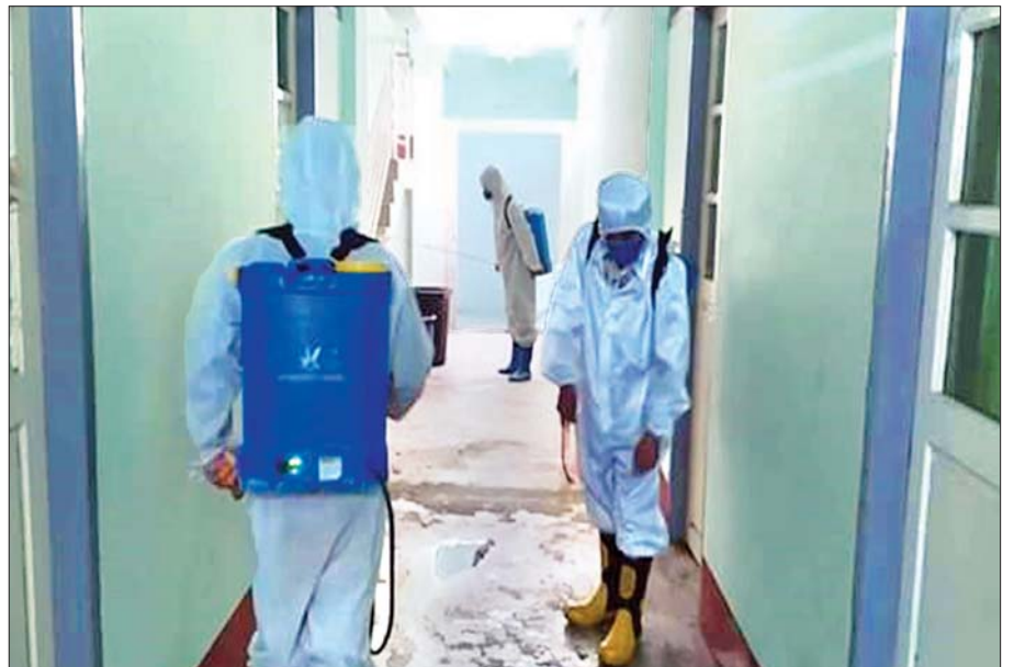
မေ ၂၃ ရက်က စစ်ကိုင်းတိုင်းဒေသကြီး ရွှေဘိုမြို့ TWS ကိုယ်ပိုင်အထက်တန်းကျောင်းတွင် COVID-19 ကာကွယ် ဆေးဖျန်းခြင်း ဆောင်ရွက်စဉ်။