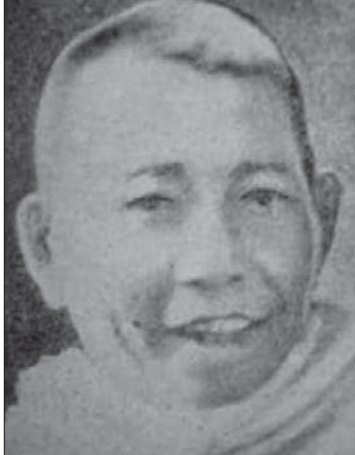
ဝိုင်အမ်ဘီ ဆရာတင်

နုရယ်။ အဝမ်းကြည်အေး ။ ။ ဒါပေမယ့် ဟိုကား က အောင်မြင် တယ်။ ကြည်စိုးထွန်း ။ ။ အဲဒီတုန်းက ပုံ တွေ တွေဖူးသေး တယ်၊ မေသစ်က နှစ်ကိုယ်ခွဲထင်တယ်။ အမေဘဝရော ပါတယ်ထင်တယ်။ အဝမ်းကြည်အေး ။ ။ မဟုတ်ဘူး တစ် ကိုယ်တည်းပဲ။ ကြည်စိုးထွန်း ။ ။ အဲ တစ်ကိုယ် တည်း ဆိုလည်း အသက်ကြီးတဲ့အခန်းပါတယ် ထင်တယ်။