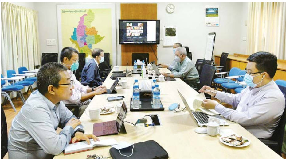
ရန်ကုန် မေ ၁၄

ကိုဗစ်-၁၉ ကာကွယ်ထိန်းချုပ်ကုသရေးနှင့် စစ်လျဉ်း၍ တိုင်းရင်းသား လက်နက်ကိုင်အဖွဲ့အစည်းများနှင့် ညှိနှိုင်းပူးပေါင်းရေးကော်မတီသည် ယနေ့ နံနက် ၁၀ နာရီက ရန်ကုန်မြို့ ရွှေလီလမ်းရှိ အမျိုးသားပြန်လည်သင့်မြတ်ရေး နှင့် ငြိမ်းချမ်းရေးဗဟိုဌာန (NRPC) တွင် ပအိုဝ်းအမျိုးသားလွတ်မြောက်ရေး အဖွဲ့ချုပ် (PNLO) နှင့် Online Video Conferencing စနစ်ဖြင့် ချိတ်ဆက်၍ ကိုဗစ်-၁၉ ဆိုင်ရာ လုပ်ငန်းညှိနှိုင်းအစည်းအဝေးကို ကျင်းပသည်။