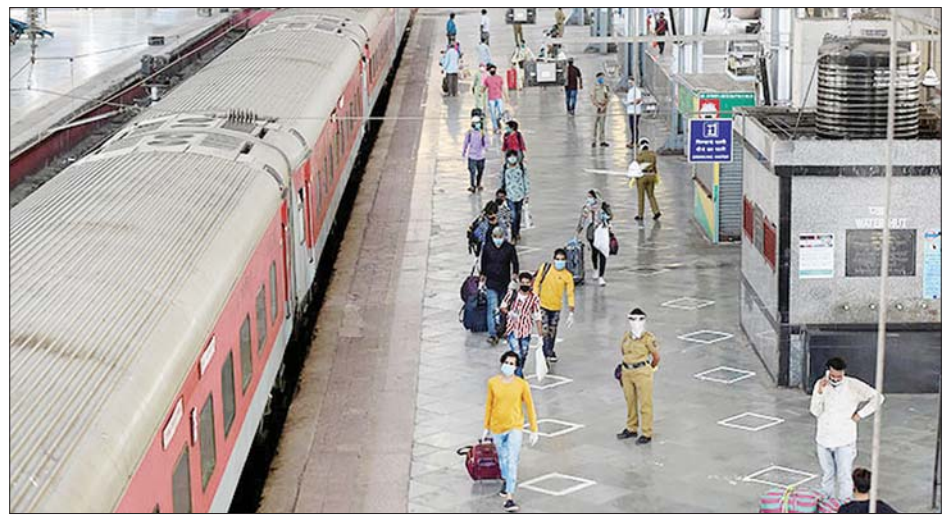
မွမ်ဘိုင်းမြို့ ဘူတာကြီးမှ နယူးဒေလီသို့ထွက်ခွာမည့် အထူးရထားပေါ်သို့ တက်ရန်ပြင်ဆင်နေသည့် ခရီးသည်များအား တွေ့ရစဉ်။