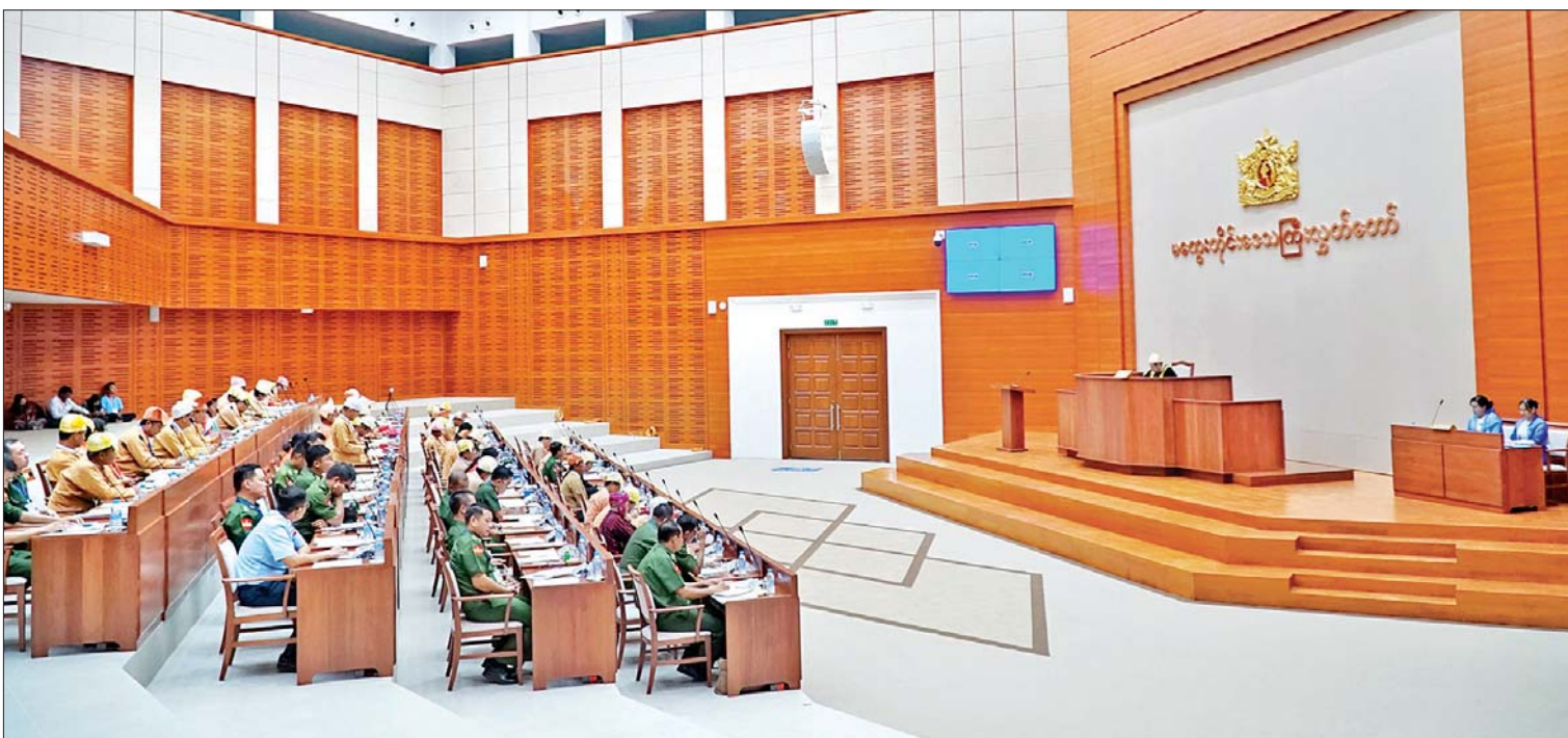
မကွေးတိုင်းဒေသကြီးလွှတ်တော်အစည်းအဝေး ကျင်းပနေမှုကို တွေ့ရစဉ်။

လူထုအခြေပြု ခရီးသွားလုပ်ငန်းများ အောင်မြင်လာသည့်အတွက် (၄)နှစ်တာ ကာလအတွင်း ဂန့်ဂေါခရိုင် ထီးလင်းမြို့နယ် ထန်းပင်ကုန်းကျေးရွာနှင့် ပခုက္ကူခရိုင် ပခုက္ကူမြို့နယ် ကျွန်းကလေးကျေးရွာတို့ တွင် လူထုအခြေပြုခရီးသွားလုပ်ငန်း (CBT)များ