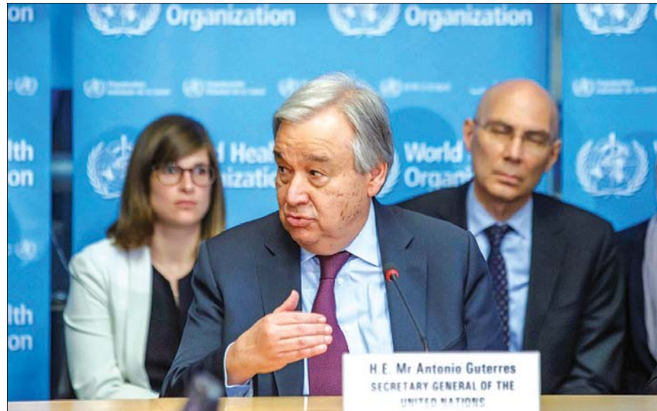
ကုလသမဂ္ဂအထွေထွေအတွင်းရေးမှူးချုပ် အန်တိုနီယိုဂူတာရက်စ်။

ဖြစ်စေသည့် အခြေအနေများဖြစ်ကြောင်း ကုလသမဂ္ဂအထွေထွေအတွင်းရေးမှူးချုပ် အန်တိုနီယိုဂူတာရက်စ်က ပြောကြားခဲ့သည်။ စိတ်ဖိစီးမှုနှင့် စိတ်ဓာတ်ကျဆင်းမှုများအပါအဝင် စိတ်ကျန်းမာရေးဆိုင်ရာ ပြဿနာများသည် ကျွန်ုပ်တို့ ကမ္ဘာတွင် ကြေကွဲဝမ်းနည်းမှုများ ကြီးစိုးလာစေသည့်အတွက် စိတ်ပိုင်းဆိုင်ရာထိခိုက်ခံစားရသူများကို အကူအညီပေးကာ ၎င်းတို့ဘက်မှ ရပ်တည်ပေးရမည်ဖြစ်ကြောင်း ၎င်းက ပြောကြားခဲ့သည်။ ဆင်ပွား