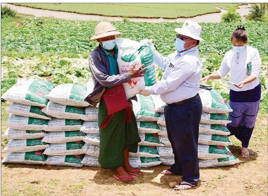
ပြည်နယ်ဝန်ကြီး ဦးစိုးလုံကျော် တောင်သူတစ်ဦးအား မြေဆီထောက်ပံ့ပေးစဉ်။

ရှမ်းပြည်နယ်တောင်ပိုင်း ဟဲဟိုးမြို့နှင့် ကလေးမြို့နယ် မြင်းမထိကျေးရွာ တွင် တောင်သူများ စိုက်ပျိုးထားသော ဂေါ်ဖီထုပ်၊ မုန့်ညင်း၊ ဂန္ဓမာပန်းများသည် အရောင်းအဝယ်မဖြစ်သောကြောင့် အရုံးနှင့်ရင်ဆိုင်နေရသဖြင့် ပြည်နယ်စိုက်ပျိုးရေး၊ မွေးမြူရေးနှင့် ဆည်မြောင်းဝန်ကြီးဦးစိုးလုံကျော်က မေ ၁၃ ရက်တွင် ဟဲဟိုးမြို့ စိုက်ပျိုးထုတ်လုပ်တင်ပို့ရောင်းချသူများအသင်း အာလူး၊ ဂေါ်ဖီအစုအဖွဲ့၊ ကလေးဇန်အစည်းအဝေးခန်းမ၌ တောင်သူများနှင့် တွေ့ဆုံသည်။