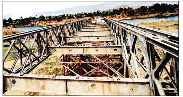
မကွေးတိုင်းဒေသကြီး ဂန့်ဂေါမြို့နယ် တောင်ခင်ရန်းရွာ - သာလင်းရွာ - မြင်သားကျေးရွာများ ကျေးရွာချင်းဆက်လမ်းတွင် တံတားဦးစီးဌာနက ပေ ၈၁၀ ရှိ မြစ်သာမြစ်ကူးတံတားကို တိုင်းဒေသကြီး အစိုးရအဖွဲ့ ခွင့်ပြုချက်အရ ၂၀၁၈-၂၀၁၉ ဘဏ္ဍာနှစ် ခွင့်ပြုငွေကျပ်သန်း ၉၀၀ နှင့် ၂၀၁၉-၂၀၂၀ ဘဏ္ဍာနှစ် ခွင့်ပြုငွေကျပ်သန်း ၄၀၀ တို့ဖြင့် တံတားအထူးအဖွဲ့ (၃) က တာဝန်ယူ ဆောက်လုပ်လျက်ရှိရာ တည်ဆောက်ရေးလုပ်ငန်းခွင်ကို မေ ၁၄ ရက်က တွေ့ရစဉ်။ ၁၄၄