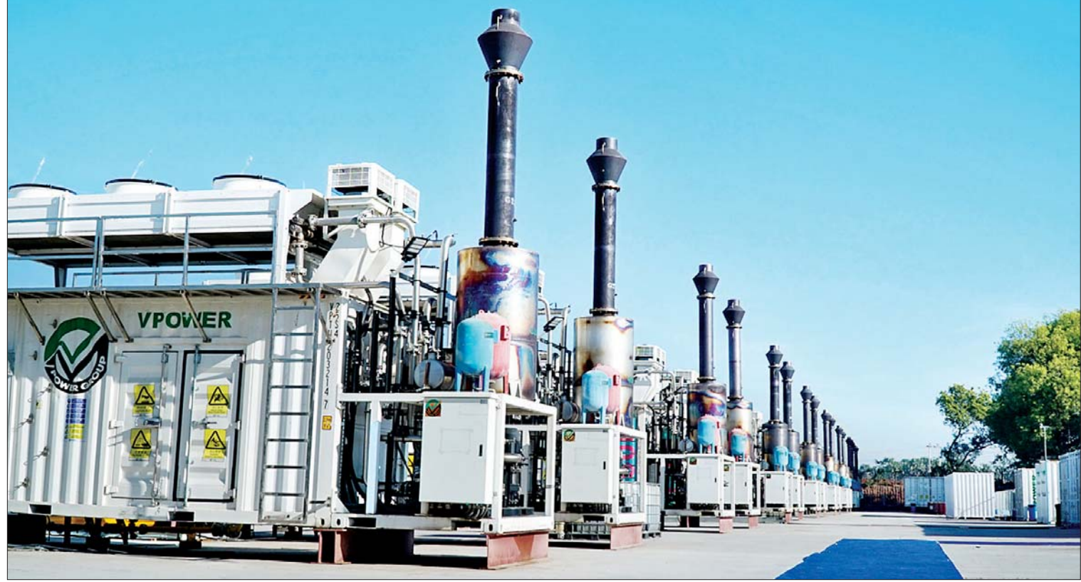
မကွေးတိုင်းဒေသကြီးရှိ သဘာဝဓာတ်ငွေ့သုံး လျှပ်စစ်ဓာတ်အားပေးစက်ရုံကို တွေ့ရစဉ်။

ရွာ လျှပ်စစ်ဓာတ်အားရရှိရေး ဆောင်ရွက်ပေးနိုင်ခဲ့သည်။ ထို့ပြင် သရက်ခရိုင် အောင်လံမြို့တွင် ၆၆/၆ ဒသမ ၆ ကေဗီ ၅ အမိဗီအေ ၆၆/၁၁ ကေဗီ ၁၀ အမိဗီအေ ဓာတ်အားခွဲရုံသို့ ပြောင်းလဲတည်ဆောက်ပေးခြင်း၊ မင်းလှမြို့တွင် ၃၃/၆ ဒသမ ၆ ကေဗီ ၁ ဒသမ ၂၅ အမိဗီအေမှ ၃၃/ ၁၁ ကေဗီ ၃ ဒသမ ၂၅ အမိဗီအေသို့ ပြောင်းလဲဓာတ်အားပေးခြင်းဖြင့် ဓာတ်အား ဖြန့်ဖြူးမှုစနစ် ကောင်းမွန်စေရေး ဆောင်ရွက်ပေးခဲ့သည်။ အချုပ်ပို (ခ) သို့