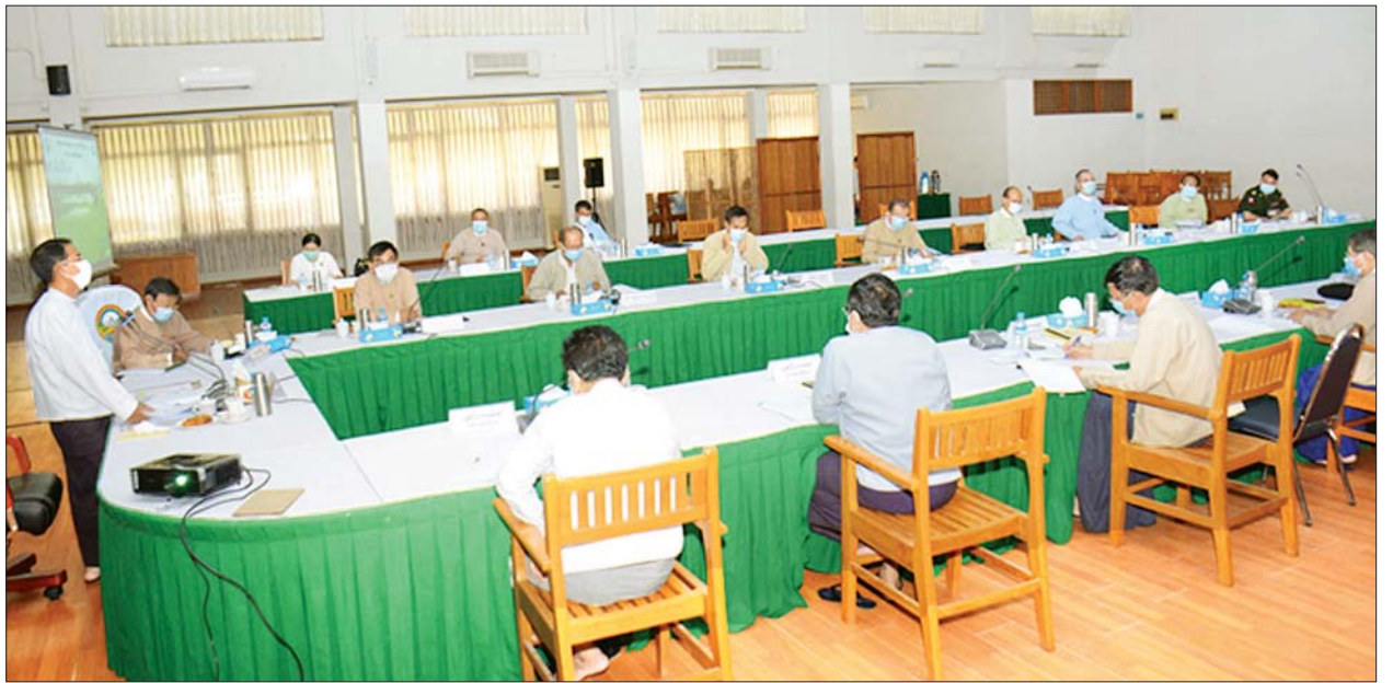
ပြည်ထောင်စုဝန်ကြီး ဒေါက်တာအောင်သူ ဗဟိုလယ်ယာမြေစီမံခန့်ခွဲမှုအဖွဲ့၏ (၂၈)ကြိမ်မြောက် လုပ်ငန်းညှိနှိုင်းအစည်းအဝေးတွင် အမှာစကားပြောကြားစဉ်။

လယ်ယာမြေလုပ်ကိုင်မှု အငြင်းပွားမှု လုပ်ငန်းဆောင်ရွက်ချက်များနှင့် ပတ်သက်၍ လယ်ယာမြေစီမံခန့်ခွဲမှုဆိုင်ရာ ဆောင်ရွက်ချက်များတွင် ကြန့်ကြာမှုကိစ္စအပေါ် ထိန်းကျောင်းကြပ်မက် ဆောင်ရွက်သွားရန်လိုကြောင်း၊ လယ်ယာမြေဥပဒေတွင် ပြဋ္ဌာန်းထားသည့်အတိုင်း ပြည်သူများထံ ပေးအပ်ထားသည့် အခွင့်အရေးနှင့် ရပိုင်ခွင့်များ လိုက်နာဆောင်ရွက်ဖွယ်ရာများကို ပြည်သူများ သိရှိနိုင်ရန်အတွက် သတင်းစာ၊ မီဒီယာများမှတစ်ဆင့် ပြည်သူများထံ