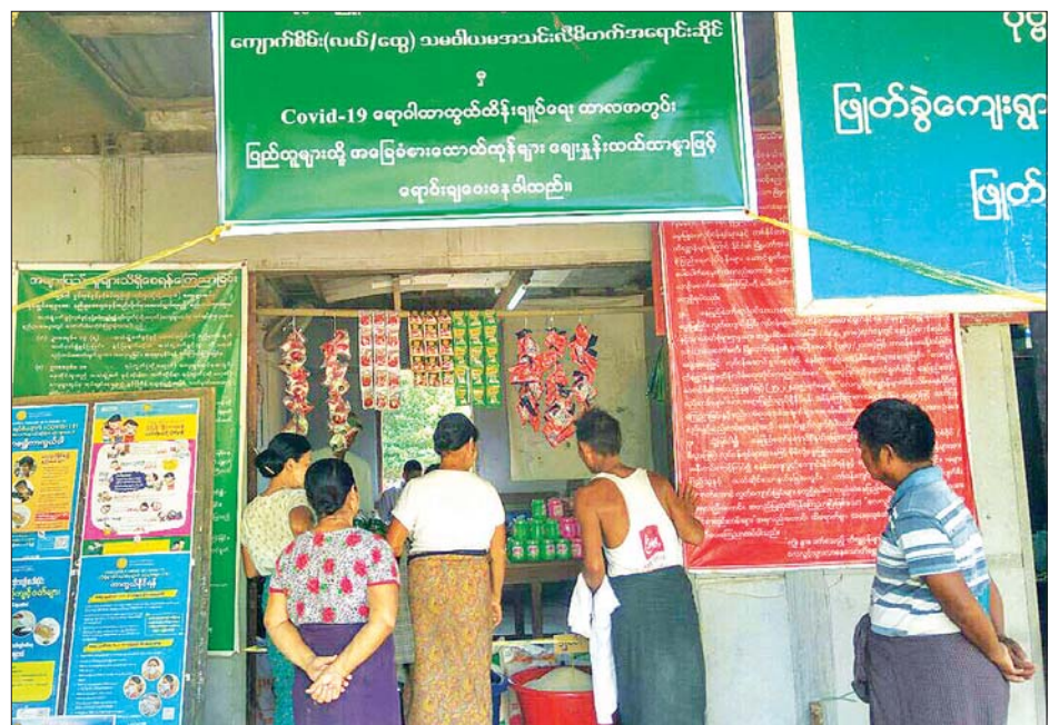
ပုဗ္ဗသီရိမြို့နယ် ဖြတ်ခွဲကျေးရွာ၌ သမဝါယမအသင်းဆိုင် ဖွင့်လှစ်ရောင်းချပေးနေစဉ်။

မဖြစ်မနေ တပ်ဆင်သွားလာကြရန် အသိပညာပေးခြင်း ဆောင်ရွက်ပြီး နှာခေါင်းစည်းမတပ်ဘဲ သွားလာကြသူ များကိုလည်း နှာခေါင်းစည်းများ အခမဲ့ဖြန့်ဝေပေးခဲ့ကြ သည်။ ထိုသို့ အသိပညာပေးနှင့် နှာခေါင်းစည်းများ အခမဲ့ ဖြန့်ဝေပေးခြင်းကို မေ ၁၃ ရက်မှစတင်၍ မေ ၁၅ ရက် အထိ ဆောင်ရွက်မည်ဖြစ်ကာ နှာခေါင်းစည်း မတပ်ဘဲ သွားလာနေသူများကို အရေးယူသွားမည် ဖြစ်ပါသည်။ မြို့နယ်အတွင်း ကိုဗစ်-၁၉ ရောဂါ ကူးစက် ပျံ့နှံ့မှုများ မရှိစေရေးအတွက် ရောဂါကြိုတင်ကာကွယ်ရေး လုပ်ငန်းများကိုလည်း မြို့နယ် ကိုဗစ်-၁၉ ထိန်းချုပ်ရေး နှင့် အရေးပေါ် တုံ့ပြန်ရေးကော်မတီမှ အရှိန်အဟုန်ဖြင့် ဆောင်ရွက်လျက်ရှိကြောင်း သိရပါသည်။ ဇင်မင်းထိုက်(ထန်းတပင်)