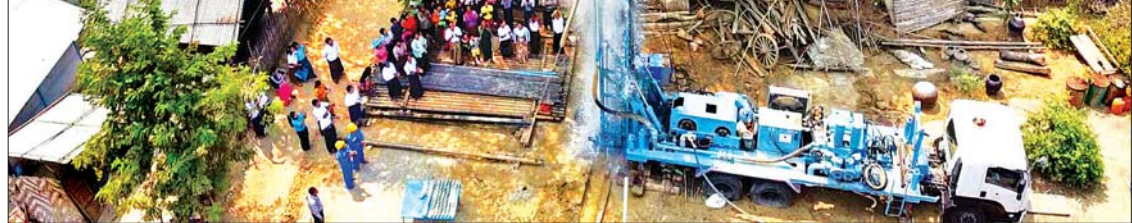
ရေစိုက်မြို့နယ်တွင် ကျေးလက်ရေရရှိရေးဆောင်ရွက်နေမှု တွေ့ရစဉ်။

ဆည်တာတံမံများ မကွေးတိုင်းဒေသကြီးအတွင်း တည်ရှိသည့် ရေဝတီမြစ်၊ မုန်းချောင်း၊ မန်းချောင်း၊ စလင်းချောင်း၊ ယောချောင်း၊ ပင်းချောင်းနှင့် မြစ်သာမြစ်တို့မှ ရေကိုအသုံးပြုနိုင်ရန် ဘက်စုံ ရေလှောင်တံမံကြီးများ တည်ဆောက်ကာ ဒေသတွင်း စိုက်ပျိုးရေးလုပ်ငန်းများအတွက် အသုံးပြုလျက်ရှိသည်။