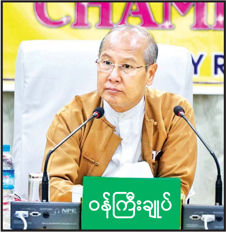
မကွေးတိုင်းဒေသကြီး ဝန်ကြီးချုပ် ဒေါက်တာ အောင်မိုးညို

၎င်းတို့ တာဝန်ယူဆောင်ရွက်သည့် ၄ နှစ်တာကာလအတွင်း ကျေးရွာပေါင်း ၁၁၇၂ ရွာမီးလင်းရေးဆောင်ရွက်ပေးနိုင်ခဲ့ပြီး ၂၀၁၆-၂၀၁၇ ဘဏ္ဍာနှစ်တွင် တိုင်းဒေသကြီးအတွင်းရှိ အိမ်ခြေ၏ ၁၇ ရာခိုင်နှုန်းသာ မီးရရှိခဲ့ရာမှ ယခုနှစ်ကုန်တွင် ၅၀ ရာခိုင်နှုန်းကျော် မီးရရှိနိုင်ရေးအတွက် ကြိုးပမ်းဆောင်ရွက်လျက်ရှိသည်။ “မကွေးတိုင်းဒေသကြီးအတွင်း ၂၀၁၆ ခုနှစ်တွင် အိမ်ထောင်စုစုပေါင်းရဲ့ ၁၇ ရာခိုင်နှုန်းသာ လျှပ်စစ်မီးရရှိခဲ့ပေမယ့် ယခုနှစ်မှာ ခရိုင် ၁၆ ခရိုင်နဲ့ မြို့နယ် ၂၅ မြို့နယ်ရှိ အိမ်ထောင်စုပေါင်း ၉၁၉၇၇၇ နဲ့ အိမ်ထောင်စု ၃၁၉၁၆၁ စုခန့်ဟာ ဓာတ်အားစနစ်နဲ့ လျှပ်စစ်ဓာတ်အား ရရှိသုံးစွဲနေပြီဖြစ်တဲ့အတွက် ၃၄ ဒသမ ၇ ရာခိုင်နှုန်းခန့် လွှမ်းခြုံနိုင်ခဲ့ပြီဖြစ်ပါတယ်” ဟု ဒေါက်တာအောင်မိုးညိုက ရှင်းပြသည်။ ကျေးရွာများသို့ ဓာတ်အားလွှမ်းခြုံမှု တိုင်းဒေသကြီးအတွင်း ကျေးရွာပေါင်း ၄၇၈၈ ရွာရှိသည့်အနက် ဓာတ်အားစနစ်ဖြင့်