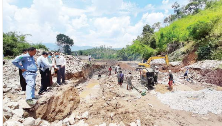
မိုင်းဖြတ်၌ ဆောင်ရွက်လျက်ရှိသော ဒေသဖွံ့ဖြိုးရေးလုပ်ငန်းများကို တွေ့ရစဉ်။

ရရှိခဲ့သည့် ဒေသဖွံ့ဖြိုးရေးလုပ်ငန်းများကို မေ ၁၄ ရက်က ပြည်နယ်လွှတ်တော်ကိုယ်စားလှယ် ဦးအားကို၊ မြို့နယ်တည်ဆောက်ရေးကော်မတီ