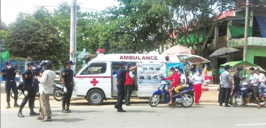
ကွမ်းခြံကုန်းမြို့နယ်ရဲတပ်ဖွဲ့မှ တပ်ဖွဲ့ဝင်များသည် မေ ၁၂ ရက်တွင် ဈေးပိုင်းရပ်ကွက် အထက-၂ ကျောင်းရှေ့၌ ခရီးသွားလာနေကြသော ပြည်သူများအား ကိုဗစ်-၁၉ ရောဂါ ကာကွယ်နိုင်ရေးအတွက် နှာခေါင်းစည်းများ တပ်ဆင်၍ သွားလာကြရန်နှင့် နှာခေါင်းစည်း မတပ်ခြင်းတို့၏ အကျိုးအပြစ်များကို အသိပညာပေးဟောပြောကာ နှာခေါင်းစည်း များ အခမဲ့ဖြန့်ဝေပေးစဉ်။ ရဲပြန်ကြား