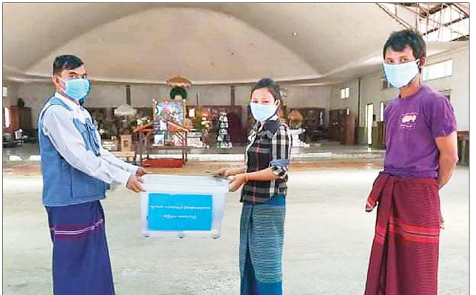
များ၊ အသိပေးနှိုးဆော်ခြင်းလုပ်ငန်းများနှင့် စိတ်ဓာတ် တွင် စဉ်ဆက်မပြတ် ဆောင်ရွက်လျက်ရှိကြောင်း ရေးရာမြင့်တင်ပေးမှုဆိုင်ရာလုပ်ငန်းများကို နေပြည်တော် သိရသည်။ ကောင်စီအပါအဝင် တိုင်းဒေသကြီး/ ပြည်နယ်အားလုံး သတင်းစဉ်

လူမှုဝန်ထမ်း၊ ကယ်ဆယ်ရေးနှင့် ပြန်လည်နေရာချ ထားရေးဝန်ကြီးဌာနအနေဖြင့် ကိုဗစ်-၁၉ ကူးစက်ရောဂါ ကာကွယ်၊ ထိန်းချုပ်၊ တုံ့ပြန်ရေးနှင့် ပတ်သက်၍ ထောက်ပံ့မှုလုပ်ငန်းများအပြင် အသိပညာပေးလုပ်ငန်း