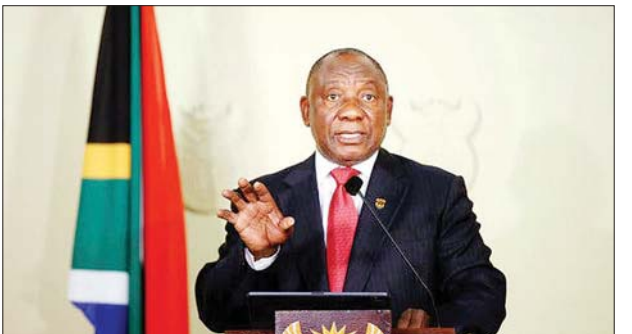
တောင်အာဖရိကသမ္မတ ဆိုင်ရယ် ရာမာဖူဆာ။