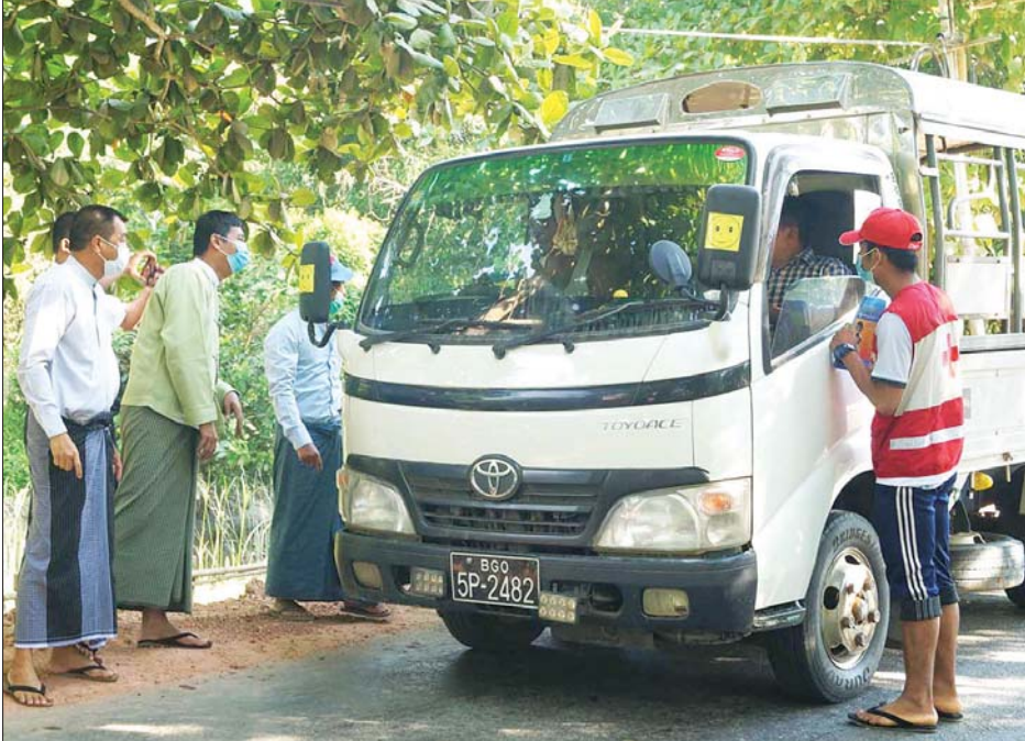
ပူးပေါင်းအဖွဲ့များက အများပြည်သူများ နှာခေါင်းစည်းတပ်ဆင်သွားလာရေး အသိပညာပေးဆောင်ရွက်စဉ်။