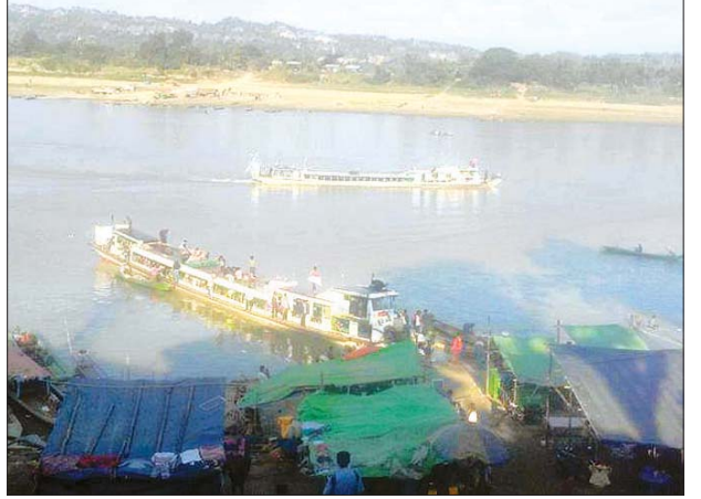
ဗုံရွာမြို့ဆိပ်ကမ်းဆိုင်က လူစီးအမြန်ရေယာဉ်တစ်စင်းကို တွေ့ရစဉ်။