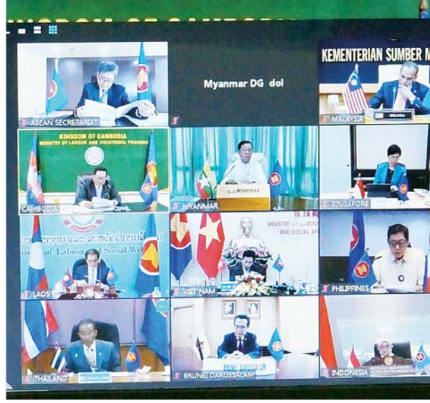
ပြည်ထောင်စုဝန်ကြီး ဦးသိန်းဆွေ VIDEO CONFERENCE စနစ်ဖြင့် ကျင်းပပြုလုပ်သည့် အာဆီယံအလုပ်သမားဝန်ကြီးများအဆင့် အထူးအစည်းအဝေးသို့ ပါဝင်တက်ရောက် ဆွေးနွေးစဉ်။

“Post Pandemic recovery Plan” ကပ်ရောဂါ ကာလလွန်မြောက်ပြီး နောက် ပြန်လည်ထူထောင်ရေး အစီအစဉ်ကိုရရှိနိုင်ရန် စောင့်မျှော်လျက် ရှိကြောင်း ပြောကြားသည်။ အစည်းအဝေးတွင် ပြည်ထောင်စု ဝန်ကြီး ဦးသိန်းဆွေ က အလုပ်သမား များ အပေါ် ကိုဗစ်-၁၉ သက်ရောက်မှု များကို တုံ့ပြန်မည့် သက်ဆိုင်ရာ မူဝါဒများ၊ အစီအစဉ်များ၊ လူမှု အထောက်အပံ့များ အထူးအဖြင့် လုပ်ခလစာ/ဝင်ငွေ၊ အလုပ်အကိုင်၊ လုံခြုံရေး၊ ကျန်းမာရေးနှင့်စပ်လျဉ်း၍ မြန်မာနိုင်ငံတွင် လက်ရှိဖြစ်ပွားနေ သော ကိုဗစ်-၁၉ ကပ်ရောဂါကြောင့် အလုပ်သမားများ အထူးအဖြင့် ဝင်ငွေကုသပေးခြင်း ပုံမှန်မဟုတ်သော စီးပွားရေးလုပ်ငန်းများနှင့် ထိခိုက် လွယ်သောကဏ္ဍများတွင် လုပ်ကိုင် နေသည့် အလုပ်သမားများ၏အခွင့် အရေး၊ ကျန်းမာရေးနှင့်ပတ်သက်၍ အချိန်နှင့်တစ်ပြေးညီ ထောက်ပံ့ကူညီ ဆောင်ရွက်လျက်ရှိသည့် အခြေအနေ များ၊ ကပ်ရောဂါ၏ ရိုက်ခတ်မှုကြောင့် အလုပ်ရပ်စဲနေရသည့် အလုပ်သမား များကို အလုပ်ရှင်မှ ထောက်ပံ့ကူညီ ပေးခြင်းနှင့် လူမှုဖူလုံရေး အထောက် အပံ့နှင့် အလုပ်လက်မဲ့ခံစားခွင့်များ ထောက်ပံ့ ကူညီပေးနေသည့် အခြေ အနေများ၊ နိုင်ငံတော်အစိုးရအနေဖြင့် အများပြည်သူများအား အသိပညာ ပေးလုပ်ငန်းများ ဆောင်ရွက်ခြင်း၊ အများပြည်သူသွားလာသည့်နေရာ များတွင် ပိုးသတ်ဆေးဖျန်းခြင်း၊ ပြည်ပနိုင်ငံများမှ ပြန်လာသော ပြည်သူများအား quarantine cen- ters အဖြစ် မြန်မာနိုင်ငံ တစ်ဝန်းရှိ ဆေးရုံများ၊ အားကစားရုံများ၊ သင်တန်းကျောင်းများနှင့် စာသင် ကျောင်းများ၊ အဖွဲ့အစည်းစင်တာ များနှင့် တရားစခန်းများတွင် ဖွင့်လှစ် ထားရှိစေခြင်းတို့အပြင် ဧပြီလအတွင်း ပြည်သူများ၏ အိမ်သုံးလျှပ်စစ်