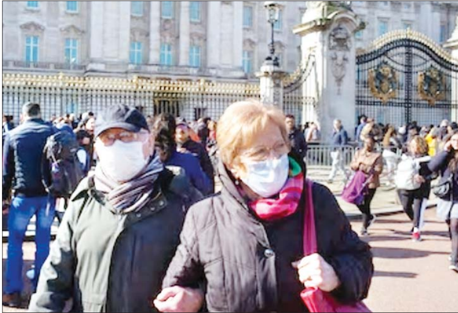
လန်ဒန်ရှိ တာကင်ဟမ်နန်းတော်၌ နှာခေါင်းစည်းဝတ်ဆင်ထားသည့် ခရီးသွားများ လာရောက်လည်ပတ်နေကြစဉ်။

အသွားအလာကန့်သတ်မှုတွေလျော့ချ ပြင်သစ်၊ အီတလီနဲ့ စပိန်နိုင်ငံတို့ရဲ့ အသွားအလာကန့်သတ်ပိတ်ဆို့မှု လျော့ချတဲ့နောက်ကို ဗြိတိန်နိုင်ငံက အမိလိက်နေသလို လူတွေကို လုပ်ငန်းခွင်ပြန်ဝင်မှုတွေ အိမ်ထဲမှ အိမ်ပြင် ထွက်ခွင့်ပြုမှုတွေလည်း ပေးနေပါတယ်။ ဩစတြီးယားက သူ့ရဲ့ဂျာမနီနဲ့ထိစပ်နေတဲ့နယ်စပ်ကို ဇွန်လအလယ်မှာ ပြန်ဖွင့်ပေးမယ်လို့ ပြောနေသလို ဘာလင်ကလည်း သူ့ရဲ့ ကုန်းတွင်းပိုင်းနယ်စပ်တွေမှာ ဗိုင်းရပ်စ်စစ်ဆေးမှုတွေကို တစ်လအတွင်း အဆုံးသတ်တော့မယ်လို့ ဆိုနေပါတယ်။ ကိုဗစ်-၁၉ ကြောင့် အထိနာခဲ့တဲ့သန်းချီသော ခရီးသွားလာမှုဆိုင်ရာလုပ်ငန်းများကိုကယ်တင်နိုင်ဖို့ ဥရောပသမဂ္ဂဟာ ယခုနေရာသီမှာ ခရီးသွားလာမှုဆိုင်ရာလုပ်ငန်းတွေ ပြန်လည်စတင်ဖို့ အဆင့်လိုက်အစီအစဉ်တွေ ရေးဆွဲဆောင်ရွက်နေပါတယ်။ ဥရောပသမဂ္ဂနယ်စပ်ထိန်းချုပ်မှုတွေကို ဖယ်ရှားပေးပြီး အများပြည်သူသယ်ယူပို့ဆောင်ရေးတွေမှာ နှာခေါင်းစည်းတပ်ဆင်ခြင်းလိုမျိုးတွေလုပ်ပြီး ရောဂါကူးစက်နိုင်ခြေအနည်းဆုံးဖြစ်အောင် ဆောင်ရွက်နေပါတယ်။