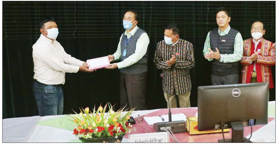
ပြည်နယ်ဝန်ကြီးချုပ် ဦးဆလင်းလျန်လွယ် အလှူငွေများလက်ခံရယူပြီး ဂုဏ်ပြုမှတ်တမ်းလွှာပြန်လည်ပေးအပ်စဉ်။