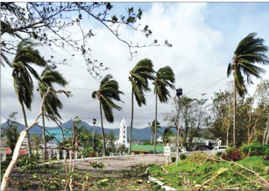
ဖိလစ်ပိုင်၌ မုန်တိုင်းကြောင့် လေပြင်းတိုက်ခတ်မှုကို တွေ့ရစဉ်။