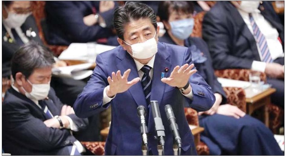
ဂျပန်ဝန်ကြီးချုပ် ရှင်ခိုအာဘေး။

အစိုးရသည် လွှတ်တော်နှစ်ရပ်ရှိ လုပ်ငန်းစဉ်ချမှတ်လမ်းညွှန်ပေးသောအဖွဲ့သို့ အစီအစဉ်များကို တင်ပြမည်