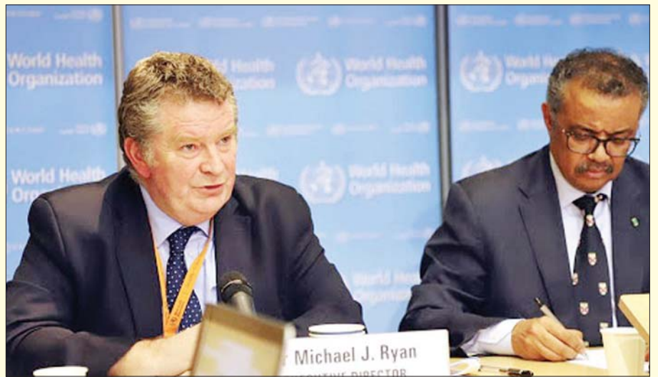
ကမ္ဘာ့ကျန်းမာရေးအဖွဲ့ အရေးပေါ်အခြေအနေဆိုင်ရာ ညွှန်ကြားရေးမှူး ဒေါက်တာ မိုက်ရန်။