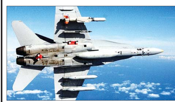
SLAMER ဒုံးကျည်များတင်ဆောင်ထားသည့် အက်ဖ်အေ-၁၈ လေယာဉ်တစ်စင်းကို တွေ့ရစဉ်။