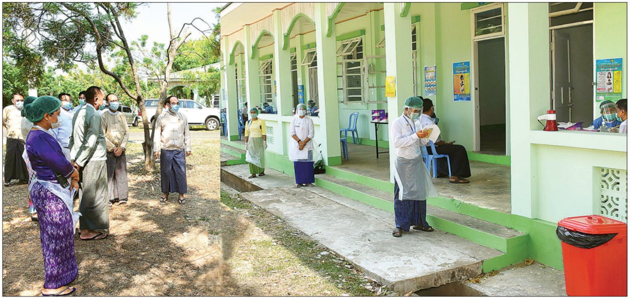
ဝန်ထမ်းများသည် ကျန်းမာရေးစစ်ဆေးခြင်းနှင့် ဓာတ်ခွဲနမူနာယူခြင်းလုပ်ငန်းများကို စနစ်ကျစွာ စီစဉ်ဆောင်ရွက်နေသည်ကို တွေ့ရှိရပါကြောင်း ပြောကြားသည်။ ကျန်းမာရေးစစ်ဆေးခြင်းနှင့် ဓာတ်ခွဲနမူနာယူခြင်းများကို မေ ၁၃ ရက်တွင် လွှတ်တော်အထောက်အကူပြုဝန်ထမ်းများအားလည်းကောင်း၊ မေ ၁၄ ရက်နှင့် မေ ၁၅ ရက်တွင် လွှတ်တော်ကိုယ်စားလှယ်များအား လည်းကောင်း ပြုလုပ်ဆောင်ရွက်ပေးလျက်ရှိကြောင်း သိရသည်။ သတင်းစဉ်

ထိုသို့သွားရောက်စဉ်တွင် ပြည်ထောင်စုဝန်ကြီးက တာဝန်ကျဝန်ထမ်းများကို တွေ့ဆုံ၍ ဓာတ်ခွဲနမူနာယူခြင်းလုပ်ငန်းများ ဆောင်ရွက်ရာတွင် ရောဂါ ဖြစ်ပွားကူးစက်မှုမရှိစေရေး လိုက်နာကျင့်သုံးရန် ကျန်းမာရေးအသိပညာပေး နှိုးဆော်မှုများ ပြုလုပ်ရမည်ဖြစ်ကြောင်း၊ ဓာတ်ခွဲနမူနာစစ်ဆေးခံမည့် သူများအား ရောဂါလက္ခဏာတစ်စုံတစ်ရာမရှိသော်လည်း ရောဂါပိုးကူးစက် ခံရမှုရှိနေနိုင်သည်ကို အသိပညာပေး ပြောကြားရမည်ဖြစ်ကြောင်း၊ ရောဂါကူးစက်မှုခံရပါက ကူးစက်မှုခံရပြီး ငါးရက်မှ ခုနစ်ရက်အတွင်းတွင် ရောဂါပိုးတွေ့ရှိနိုင်ခြေအများဆုံးဖြစ်ကြောင်း၊ ဓာတ်ခွဲစစ်ဆေးရာတွင် ရောဂါပိုးမတွေ့ရှိရသော်လည်း ဖျေဆဲခြင်းမပြုဘဲ ရောဂါကူးစက်ခံရမှု မရှိစေရေးအတွက် ဆောင်ရန်၊ ရှောင်ရန် အချက်များကို ဆက်လက်လိုက်နာ ရန်မှာ အထူးအရေးကြီးသည်ကို မှတ်တမ်းတင်ပေးကြောင်း၊ ထိုသို့ဆောင်ရွက်ခြင်း ဖြင့် မိမိကိုယ်တိုင်နှင့် မိမိ၏ မိသားစု၊ မိတ်ဆွေများထံသို့ ရောဂါကူးစက် ပြန့်ပွားခြင်းမှ ကာကွယ်နိုင်မည်ဖြစ်ကြောင်း၊ နေပြည်တော် ပြည်သူ့ ကျန်းမာရေးနှင့် ကုသရေးဦးစီးဌာနမှူးနှင့် တာဝန်ရှိသူများ၊ ကျန်းမာရေး