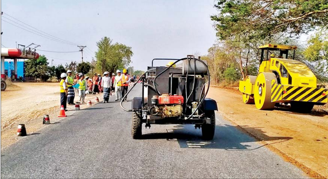
မင်းဘူး - အမ်းလမ်း ပြင်ဆင်ဆောင်ရွက်နေမှုကို တွေ့ရစဉ်။

“တိုင်းဒေသကြီးအတွင်း လမ်းပန်းဆက်သွယ်ရေး တိုးတက်ကောင်းမွန်စေရေးအတွက် လမ်းဦးစီးဌာနမှ လမ်းမိုင်ပေါင်း ၂၁၈၇/၅ မိုင်၊ ၅၄၄ ပေ ကို တာဝန်ယူဆောင်ရွက်လျက်ရှိပြီး ၎င်းလမ်းပိုင်းများအနက် လမ်းမိုင် ၄၅၄/၃ မိုင်၊ ပေ ၄၆၀ ကို ပုဂ္ဂလိကကုမ္ပဏီ ခြောက်ခုမှ B.O.T စနစ်ဖြင့် တာဝန်ယူ ဆောင်ရွက်လျက်ရှိ”