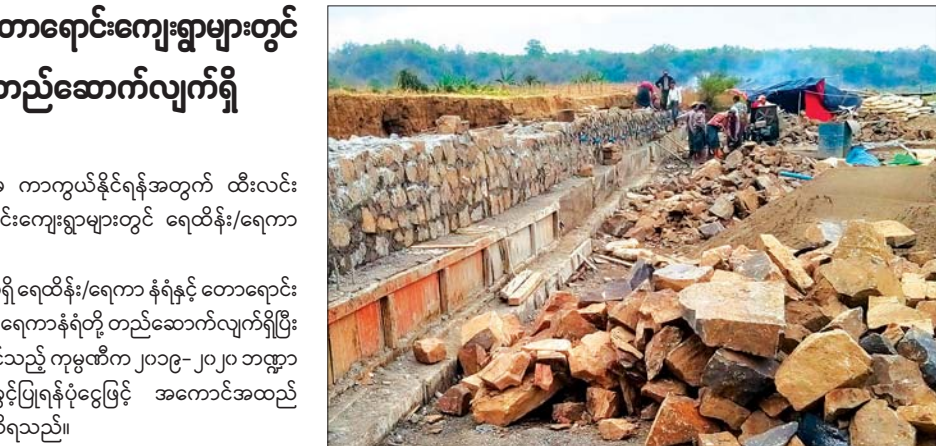
အောင်စည်(ပြန်/ဆက်)

ထီးလင်း မေ ၁၄ ကျေးရွာများ ကမ်းပြိုရေတိုက်စားခြင်းမှ ကာကွယ်နိုင်ရန်အတွက် ထီးလင်း မြို့နယ် သရက်ကျေးရွာနှင့် တောရောင်းကျေးရွာများတွင် ရေထိန်း/ရေကာ နံရံများ တည်ဆောက်လျက်ရှိသည်။ သရက်ကျေးရွာတွင် အရှည် ၁၅၆ ပေရှိ ရေထိန်း/ရေကာ နံရံနှင့် တောရောင်း ကျေးရွာတွင် အရှည်ပေ ၂၄၀ ရှိ ရေထိန်း/ ရေကာနံရံတို့ တည်ဆောက်လျက်ရှိပြီး အဆိုပါလုပ်ငန်းများကို တင်ဒါအောင်မြင်သည့် ကုမ္ပဏီက ၂၀၁၉-၂၀၂၀ ဘဏ္ဍာ နှစ် မကွေးတိုင်းဒေသကြီး အစိုးရအဖွဲ့ခွင့်ပြုရန်ပုံငွေဖြင့် အကောင်အထည် ဖော် တည်ဆောက်ခြင်းဖြစ်ကြောင်း သိရသည်။