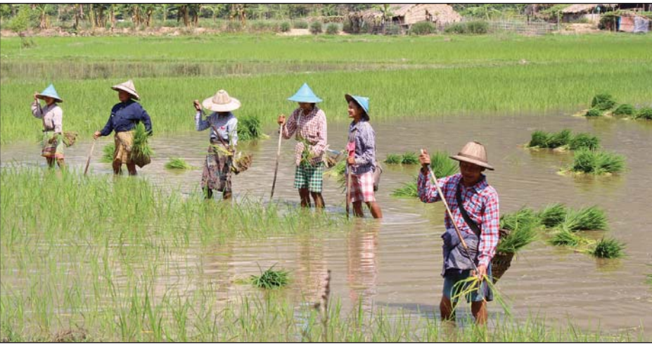
မွန်ပြည်နယ်အတွင်းမှ စပါးစိုက်ပျိုးနေသော တောင်သူလယ်သမားများ တွန်းပြောကြားသည်။ မိုးစပါးချေးငွေများကို လယ်တစ်ဧကလျှင် ကျပ် ၁၅၀၀၀ နှုန်းဖြင့် တောင်သူတစ်ဦးလျှင် လယ် ၁၀ ဧက အထိ ထုတ်ချေးပေးသွားမည်ဖြစ်ပြီး မွန်ပြည်နယ်လက်ရှိ စပါးစိုက်ပျိုးရေးအဖွဲ့မှ ဝန်ထမ်းများက ထုတ်ချေးပေးသွားမည်ဖြစ်ကြောင်း မွန်ပြည်နယ်အစိုးရက ထုတ်ပြန်ကြေညာခဲ့သည်။

ကျယ်ဝန်းတဲ့နေရာတွေမှာ ပြောင်းလဲပြီး ထုတ်ချေးပေးသွားဖို့လည်း စီစဉ်ထားတယ် "ဟု မွန်ပြည်နယ်ဘဏ်ခွဲ မန်နေဂျာက ဆက်လက်ပြောကြားသည်။