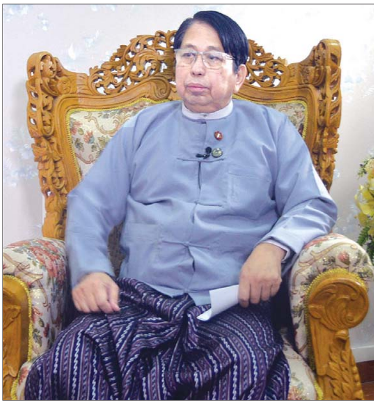
ပြည်ထောင်စုဝန်ကြီး ဒေါက်တာ ဖေမြင့်

အသိပညာပေးခြင်းနှင့် ဖျော်ဖြေမှုပေးခြင်းဆိုတဲ့ တာဝန်သုံးရပ်စလုံးကို ဆောင်ရွက်သလို သတင်းအလုပ်ကို အဓိကထား ဆောင်ရွက်တဲ့ နောက်လုပ်ငန်းတစ်ခုကတော့ သတင်းနှင့်စာနယ်ဇင်းလုပ်ငန်း ဖြစ်ပါတယ်။ သတင်းနှင့်စာနယ်ဇင်းလုပ်ငန်းအောက်မှာတော့ ကြေးမုံနဲ့ မြန်မာ့အလင်း သတင်းစာတွေကို မြန်မာဘာသာနဲ့ ထုတ်ဝေပါတယ်။ အင်္ဂလိပ်ဘာသာနဲ့ ထုတ်ဝေတဲ့ The Global New Light of Myanmar သတင်းစာကိုတော့ ပြင်ပကမ္ဘာတစ်ဝှမ်းနဲ့ ပူးပေါင်းထုတ်ဝေပါတယ်။ လုပ်ငန်းရဲ့သဘောကတော့ ပုံနှိပ်နည်းအရ ဆောင်ရွက်ရတာဖြစ်ပြီး မြန်မာ့အသံနှင့် ရုပ်မြင်သံကြားကတော့ အသံနှင့် ရုပ်သံထုတ်လွှင့်တဲ့နည်းအရ ဆောင်ရွက်ပါတယ်”ဟု ပြန်ကြားရေးဝန်ကြီးဌာနအောက်ရှိ ဌာနများအကြောင်းကို ပြည်ထောင်စုဝန်ကြီးက ရင်းလင်း ပြောကြားသည်။ ယခုအချိန်သည်နည်းပညာဖွံ့ဖြိုးတိုးတက်လာသည်နှင့်အမျှ ပြည်သူများအား တင်ဆက်လျက်ရှိသည့် အချုပ်ပို (၁) သို့