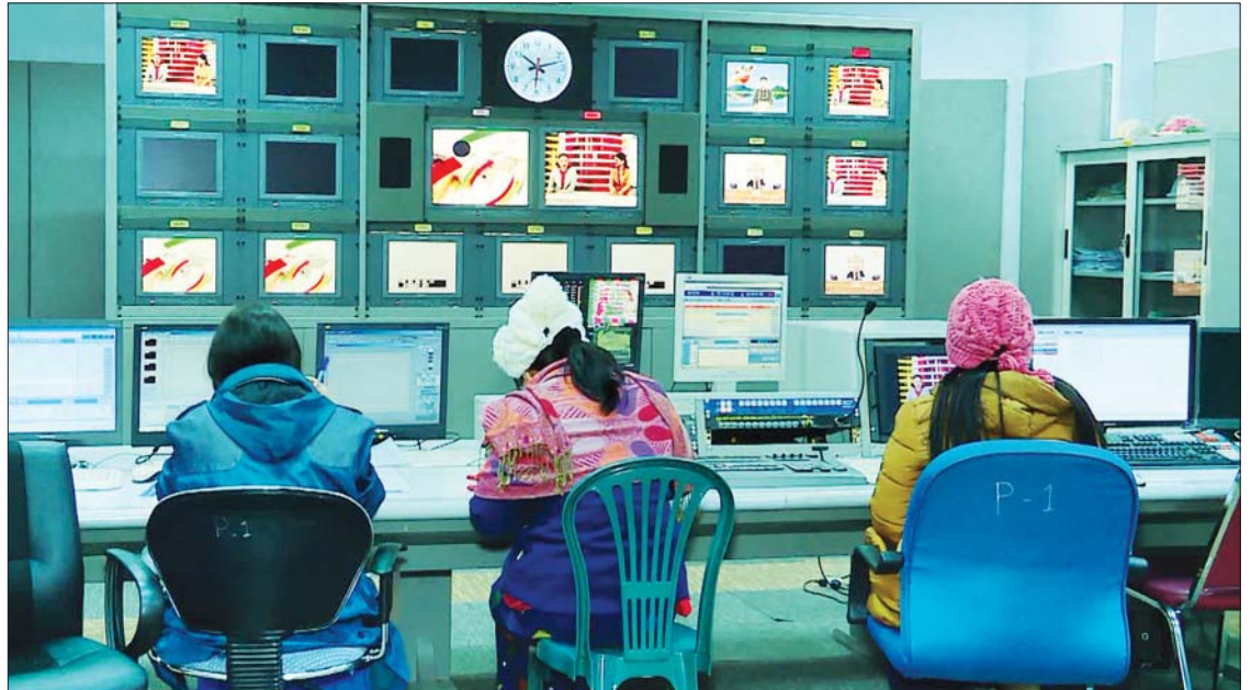
မြန်မာ့ရုပ်မြင်သံကြားမှ ရုပ်သံအစီအစဉ်များ On Air ထုတ်လွှင့်နေမှုကို တွေ့ရစဉ်။