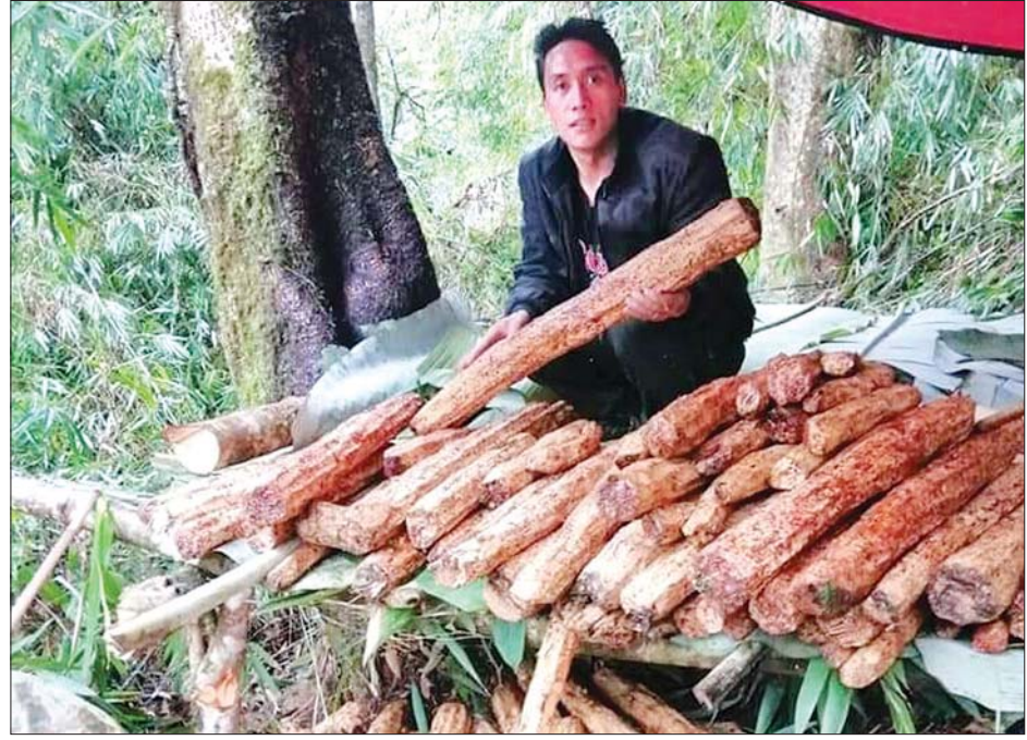
အပေါ်ခွဲကိုရွာ၍စားသုံးရသည့် ဒေသအခေါ် အထေးဟုခေါ်တွင်သော အပင်တစ်မျိုး။

ခေါင်လန်ဖူးမြို့နယ်သည် မြန်မာနိုင်ငံ၏ မြောက်ဘက်တွင်တည်ရှိပြီး ပညာရေး၊ ကျန်းမာရေး၊ စီးပွားရေးနှင့် လမ်းပန်းဆက်သွယ်ရေး စသည့် ကဏ္ဍများတွင် ဖွံ့ဖြိုးတိုးတက်မှုများစွာလိုအပ်လျက်ရှိကြောင်း သိရသည်။ ဂျေဂျေ (ခေါင်လန်ဖူး)