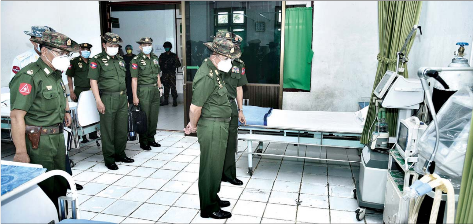
တပ်မတော်ကာကွယ်ရေးဦးစီးချုပ် ဗိုလ်ချုပ်မှူးကြီး မင်းအောင်လှိုင် ကျိုင်းတုံမြို့ တပ်မတော်ဆေးရုံ၌ Quarantine ထားရှိရန် ပြင်ဆင်ဆောင်ရွက်ထားရှိမှု အခြေအနေများအား ကြည့်ရှုစစ်ဆေးစဉ်။

နေပြည်တော် မေ ၁၁ တပ်မတော်ကာကွယ်ရေး ဦးစီးချုပ် ဗိုလ်ချုပ်မှူးကြီး မင်းအောင်လှိုင်သည် ကာကွယ်ရေးဦးစီးချုပ်(လေ) ဗိုလ်ချုပ်ကြီး မောင်မောင်ကျော်၊ ကာကွယ်ရေးဦးစီးချုပ်ရုံးမှ တပ်မတော် အရာရှိကြီးများ၊ ကြိတ်ဒေသတိုင်းစစ်ဌာနချုပ် တိုင်းမှူး ဗိုလ်ချုပ် ခင်လှိုင်နှင့် အဖွဲ့ဝင်များနှင့်အတူ ယမန်နေ့ နံနက်ပိုင်းတွင် ရှမ်းပြည်နယ်(အရှေ့ပိုင်း) ကျိုင်းတုံမြို့ တပ်မတော်ဆေးရုံ ဇီဝမော်လီကျူးဆိုင်ရာ ဓာတ်ခွဲခန်းတွင် ထားရှိ တပ်ဆင်ထားသည့် COVID-19 ရောဂါ ရှာဖွေရေး RT-PCR(Thermocycle ROTOR GENE-6000) စက်တပ်ဆင် ထားရှိမှုနှင့် အသုံးပြုပုံအဆင့်ဆင့် တို့အား လှည့်လည်ကြည့်ရှုပြီး Quarantine ထားရှိရန် ပြင်ဆင် ဆောင်ရွက်ထားရှိမှု အခြေအနေများအား ကြည့်ရှုစစ်ဆေးသည်။ ယင်းနောက် တပ်မတော် ကာကွယ်ရေးဦးစီးချုပ်သည် ကျိုင်းတုံမြို့ ပြည်သူ့ဆေးရုံမှ တာဝန်ရှိသူများနှင့် စာမျက်နှာ ၄ ကော်လံ ၁ ❁