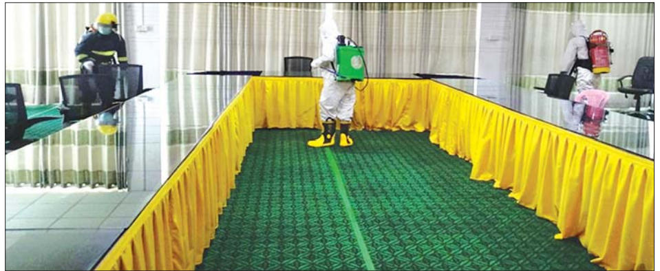
၆-၅-၂၀၂၀ ရက်က ချင်းပြည်နယ် ဟားခါးမြို့ ခရိုင်/မြို့နယ်စုပေါင်းရုံးများတွင် COVID-19 ကာကွယ်ဆေးဖျန်းစဉ်။