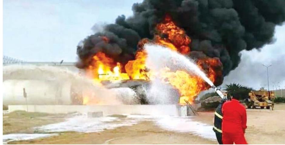
ထရီပိုလီရှိ မိုင်တီဂါလေဆိပ်တိုက်ခိုက်ခံရမှုတွင် စီးသတ်တပ်ဖွဲ့ဝင်များ မီးငြိမ်းသတ်နေစဉ်။

အင်ကာရာ မေ ၁၁ လစ်ပျားနိုင်ငံတွင် ဆောင်ရွက်နေသည့် တူရကီ၏ သံတမန်ရေးရာမစ်ရှင်များနှင့် အဆောက်အအုံများကို လစ်ပျားစစ်အာဏာသိမ်းခေါင်းဆောင်ကာလီဖာဟာကီဖီတာ၏ တပ်ဖွဲ့များက ဆက်လက်တိုက်ခိုက်နေမည်ဆိုပါက ၎င်း၏ တပ်ဖွဲ့များကို ပစ်မှတ်ထားလျက် ချေမှုန်းတိုက်ခိုက်မှုများလုပ်ဆောင်မည်ဖြစ်ကြောင်း တူရကီနိုင်ငံခြားရေးဝန်ကြီးဌာနက မေ ၁၀ ရက်တွင် သတိပေးလိုက်ကြောင်း သိရသည်။ ကာလီဖာဟာကီဖီတာ ဦးဆောင်သည့် တရားမဝင်ပြည်သူ့စစ်အဖွဲ့များသည် မကြာသေးမီအချိန်က ဆင်ခြင်မှုမဲ့သည့် တိုက်ခိုက်မှုများ အထူးသဖြင့် ထရီပိုလီမြို့၌ လုပ်ဆောင်နေသည့် တိုက်ခိုက်မှုများကို အရှိန်မြှင့်လာခဲ့ကြောင်း တူရကီနိုင်ငံခြားရေးဝန်ကြီးဌာန၏ထုတ်ပြန်ချက်တွင်ဖော်ပြထားသည်။ မေ ၉ ရက်က ဟာကီဖီတာအဖွဲ့နှင့် ဆက်သွယ်သည့် အုပ်စုများက ထရီပိုလီမြို့လယ်ကောင်ရှိ အိမ်နီးချင်းအရပ်သားများကို လက်နက်ကြီးပစ်ခတ်မှုများနှင့်အတူ ချီးကျင့်ခတ်ခတ် ၁၀၀ ကျော်ဖြင့် တိုက်ခိုက်မှု လုပ်ဆောင်ခဲ့သည်။