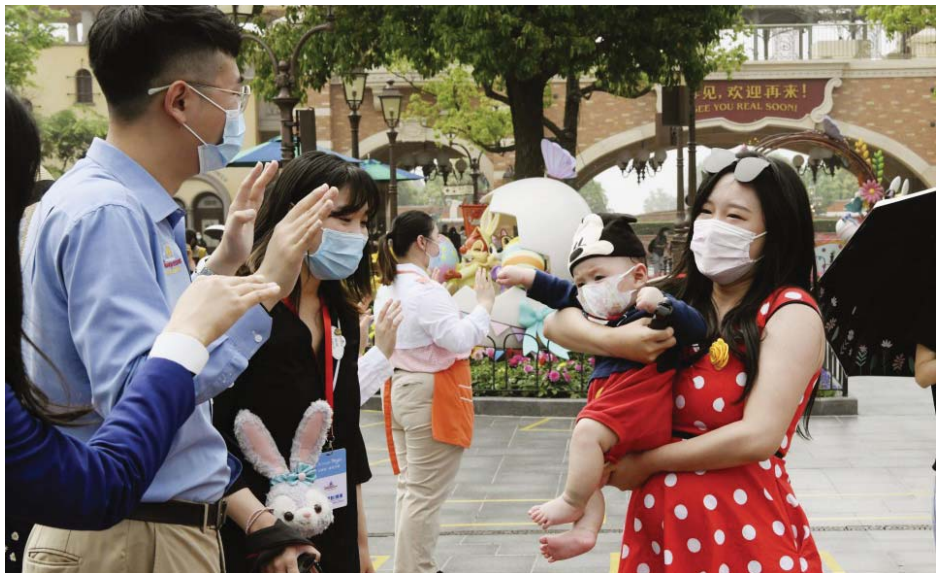
မေ ၁၁ ရက်က ရှုန်ဟိုင်း ဒစ္စနေလန်းသို့ လာရောက်လည်ပတ်ကြသူများကို တွေ့ရစဉ်။

များပြုလုပ်ထားကာ တစ်ဦးလျှင် တစ်မီတာစီ ခွာထားကြောင်း သိရသည်။ မတ် ၁၁ ရက်တွင် ဇန်နဝါရီကတည်းက ပိတ်ထားသည့် ဂျပန်စာသင်ကျောင်းကိုလည်း ပထမဆုံးအကြိမ် ပြန်လည်ဖွင့်လှစ်ခဲ့ပြီး အတန်းများပြန်စနေပြုဖြစ်သည်။ မတ်လအတွင်း၌ တရုတ်နိုင်ငံခြားရေးဝန်ကြီးဌာနက တိုင်းပြည်အတွင်းသို့ နိုင်ငံခြားသားများ ဝင်ရောက်ခြင်းကို ပိတ်ပင်ခဲ့သည်။ ကိုဗစ် -၁၉ ကူးစက်ရောဂါသည် လွန်ခဲ့သည့်နှစ်က တရုတ်နိုင်ငံ ဝူဟန်မြို့တွင်တင်ခဲ့ပြီး တရုတ်နိုင်ငံတွင် လူပေါင်း ၈၃၀၀၀ ကူးစက်ခံရပြီး ၄၆၀၀ သေဆုံးခဲ့ရသည်ဟု တရုတ်အာဏာပိုင်များက ပြောသည်။ ကျိုဒိုနယူးစ်