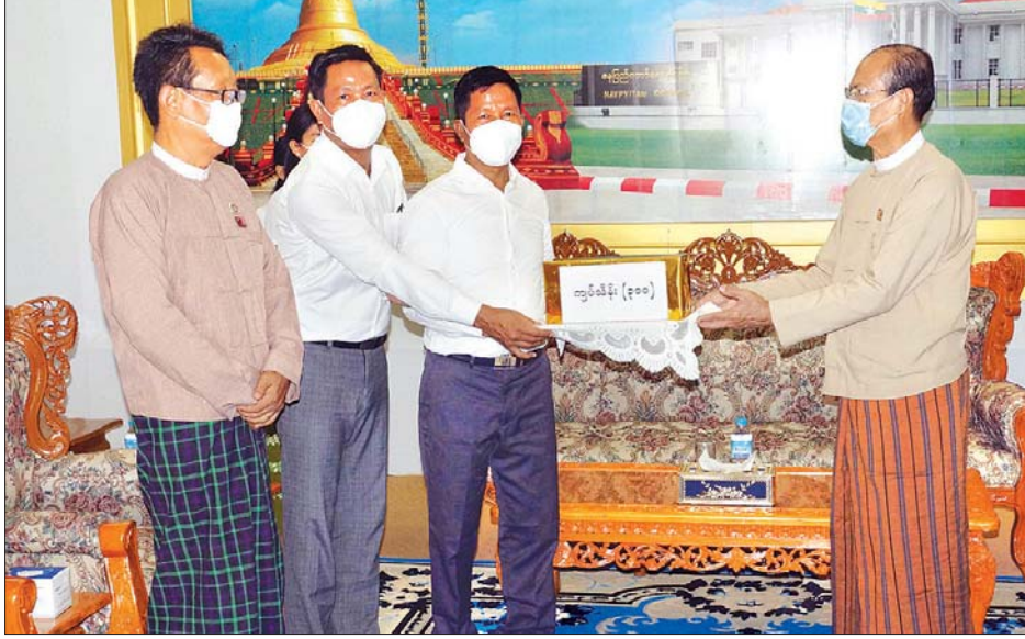
ကိုဗစ် - ၁၉ ရောဂါ လုပ်ငန်းများအတွက် အလှူငွေများလှူဒါန်းရာ နေပြည်တော်ကောင်စီဥက္ကဋ္ဌ ဒေါက်တာမျိုးအောင် လက်ခံရလေ့စဉ်။