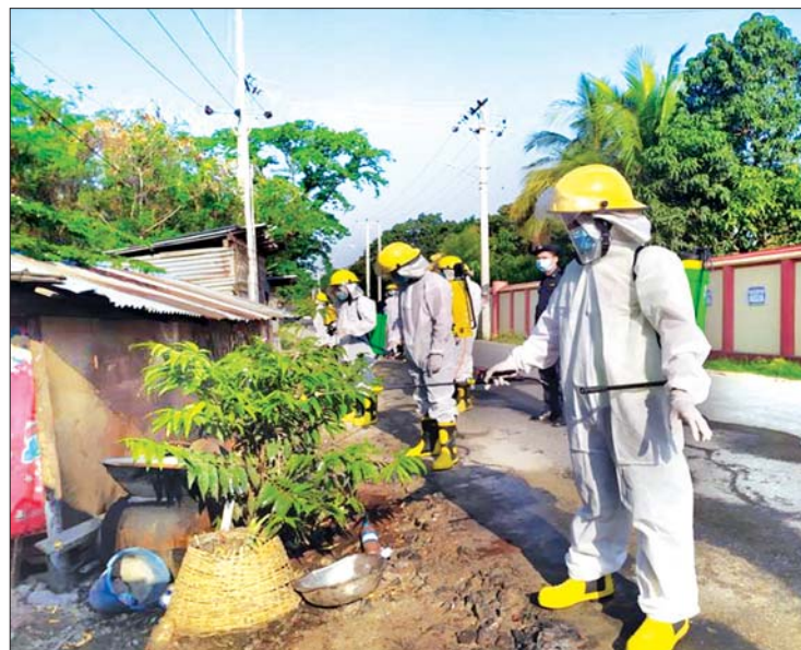
၆-၅-၂၀၂၀ ရက်က မန္တလေးတိုင်းဒေသကြီး ပြည်ကြီးတံခွန်မြို့နယ်၊ (က)ရပ်ကွက်တွင် COVID-19 ကာကွယ်ဆေးဖျန်းစဉ်။