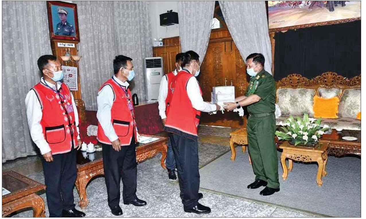
တပ်မတော်ကာကွယ်ရေးဦးစီးချုပ် ဗိုလ်ချုပ်မှူးကြီး မင်းအောင်လှိုင် UWSA(ဝ)အဖွဲ့အတွက် ထောက်ပံ့ပစ္စည်းများ ပေးအပ်စဉ်၊ ဓာတ်ပုံ - တပ်မတော်ကာကွယ်ရေးဦးစီးချုပ်ရုံး

ထိုသို့တွေ့ဆုံရာတွင် တပ်မတော် ကာကွယ်ရေးဦးစီးချုပ်က ကမ္ဘာပေါ်တွင် COVID-19 ရောဂါဖြစ်ပွားသွားပေါင်း လေးသန်းကျော်ရှိပြီဖြစ်ပြီး မိမိတို့နိုင်ငံတွင် ဖြစ်ပွားသွားပေါင်း ၁၇၈ ဦးရှိပြီ ဖြစ်ကြောင်း၊ အဆိုပါ ရောဂါသည် မမြင်ရ၊ မကြားရ၊ အနံ့မရှိနိုင်သော