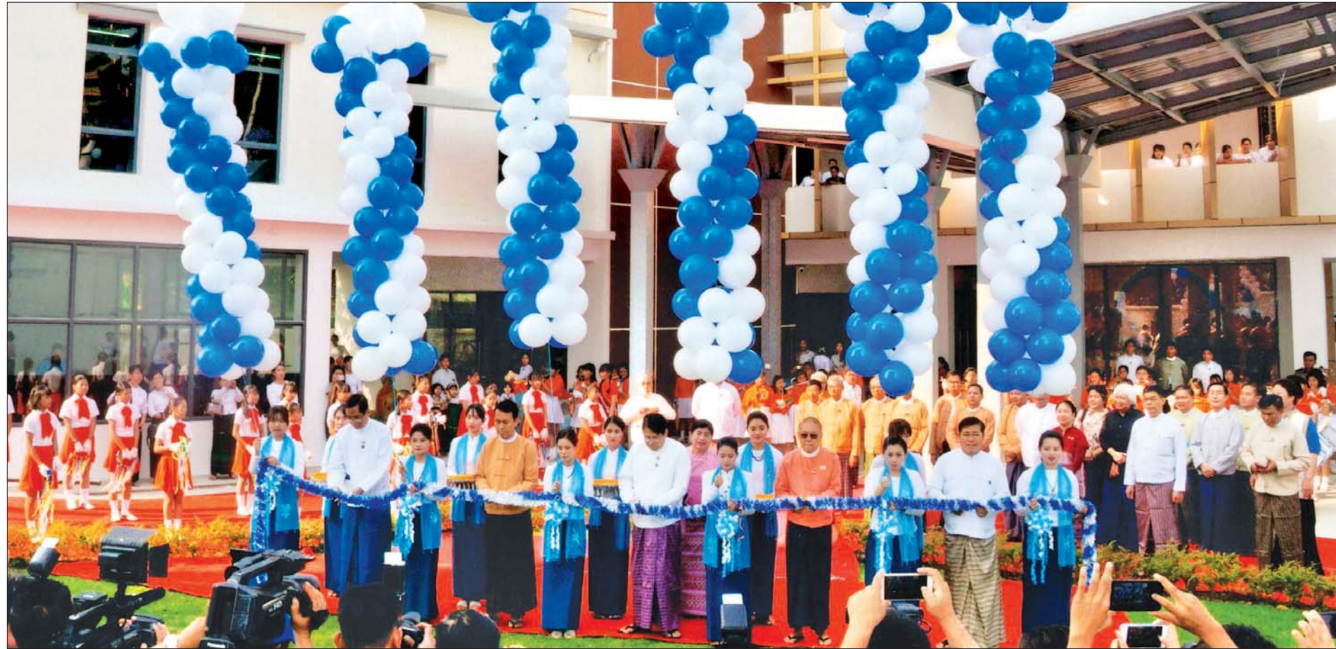
၈-၂-၂၀၂၀ ရက်က ပြည်ထောင်စုဝန်ကြီး ဒေါက်တာဖေမြင့်၊ ရန်ကုန်တိုင်းဒေသကြီး ဝန်ကြီးချုပ် ဦးဖိုးမင်းသိန်း၊ ဒုတိယဝန်ကြီး ဦးအောင်လှထွန်းနှင့် တာဝန်ရှိသူများက ရန်ကုန်မြို့ ဗဟန်းမြို့နယ်ရှိ လူထုအခြေပြုဗဟိုဌာနကို ဖြတ်ဖြတ်ဖွင့်လှစ်စဉ်။