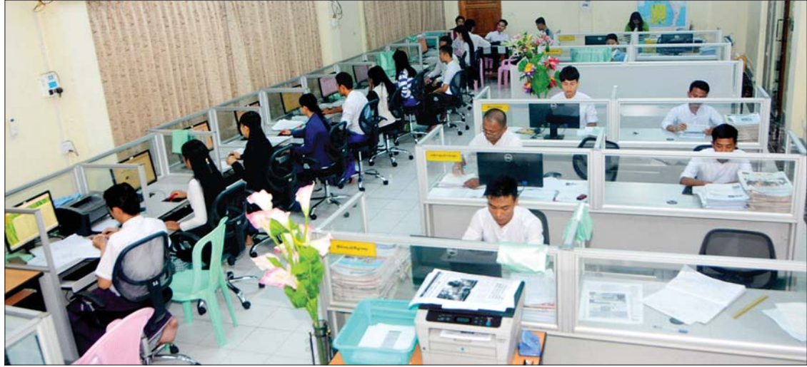
မြန်မာ့အလင်းသတင်းစာတိုက် သတင်းခန်းအတွင်း သတင်းစာလုပ်ငန်းများ ဆောင်ရွက်နေမှုကို တွေ့ရစဉ်။