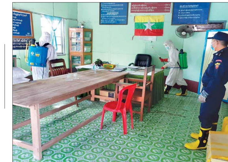
၆-၅-၂၀၂၀ ရက်က မန္တလေးတိုင်းဒေသကြီး ပျော်ဘွယ်မြို့ရှိ ရဲစခန်းတွင် COVID-19 ကာကွယ်ဆေးဖျန်းစဉ်။