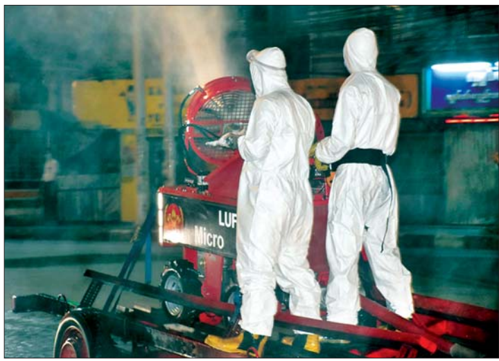
၆-၅-၂၀၂၀ ရက်က ရန်ကုန်တိုင်းဒေသကြီး ရန်ကင်းမြို့နယ်အတွင်း COVID-19 ကာကွယ်ဆေးဖျန်းစဉ်။