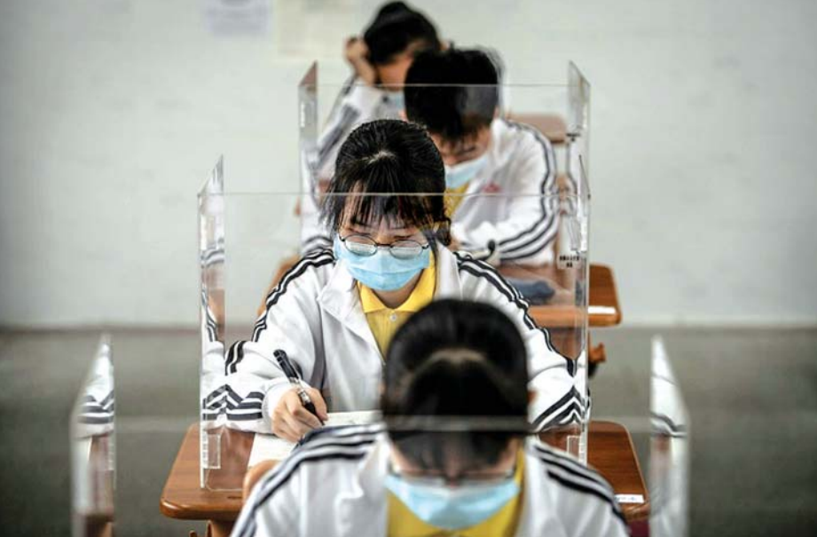
တရုတ်နိုင်ငံ ဝူဟန်မြို့ရှိ ကျောင်းတစ်ကျောင်း၏ စာသင်ခန်းထဲတွင် ကျောင်းသားကျောင်းသူများ စာသင်နေသည့်ကို တွေ့ရစဉ်။

ဥရောပရဲ့ တခြားနေရာတွေမှာ ကိုရိုနာဗိုင်းရပ်စ်