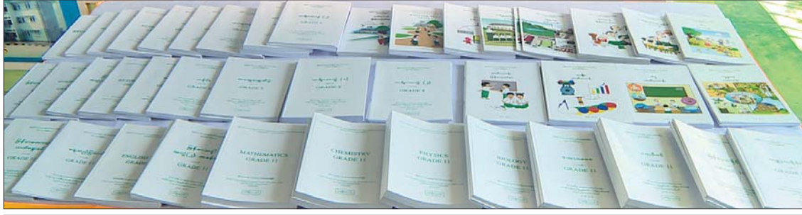
ပုံနှိပ်ရေးနှင့်ထုတ်ဝေရေးဦးစီးဌာနမှ တာဝန်ယူပုံနှိပ်ထုတ်ဝေသည့် ကျောင်းသုံးစာအုပ်နှင့် မြန်မာဂန္ထဝင် အတွဲ ၁၀၀ စာစဉ်များကို တွေ့ရစဉ်။