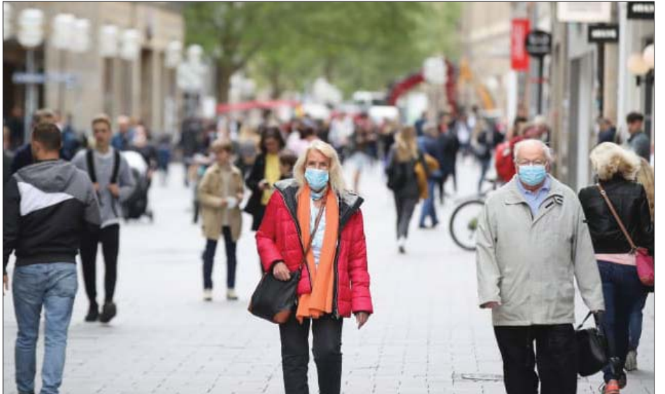
ဂျာမနီနိုင်ငံတွင် နှာခေါင်းစည်းမဖြစ်မနေတပ်ဆင်ရန် အမိန့်ထုတ်ထားသဖြင့် နှာခေါင်းစည်းတပ်ဆင်ကာ သွားလာနေကြသူများကို တွေ့ရစဉ်။

ယင်းဖြစ်ရပ်မှတစ်ဆင့် ဆက်စပ်ကာ မေ ၁၁ ရက်အထိ လူပေါင်း ၈၆ ဦး ကူးစက်ခဲ့ကြောင်း သိရသည်။ ဂျာမနီနိုင်ငံတွင်လည်း ပိတ်ဆို့ကန့်သတ်မှုများဖြေလျှော့ပြီးနောက် ကိုဗစ် -၁၉ ကူးစက်ခံရသူ အရေအတွက် ပြန်လည်မြင့်တက်လာကြောင်း တရားဝင်အချက်အလက်များကဖော်ပြလျက်ရှိသည်။ ဗိုင်းရစ်ပျံ့နှံ့မှုနှုန်းကို အချိန်တိုအတွင်းတိတိကျကျ ခြေရာခံမလိုက်နိုင်သည့်အတွက် အချက်အလက်များပေါ်မူတည်၍ အတည်ပြုလူနာများ မည်မျှရှိလာမည်ကို ခန့်မှန်းရပြီး ယင်းကို တိုးပွားလာသည့်နှုန်းဟု သတ်မှတ်သည်။ ယင်းနှုန်းအရ ဂျာမနီနိုင်ငံ၏ တိုးပွားမှုသည် တစ်ဦးထက်မကရှိနေသဖြင့် ရောဂါပျံ့နှံ့မှုနှုန်း ပြန်လည်မြင့်တက်လာနိုင်သည်ဟု ဖော်ပြလျက်ရှိသည်။ နောက်ထပ် သတင်းအချက်အလက်များအရ ကူးစက်ခံရမှုပြန်လည်မြင့်တက်လာနိုင်သည်ဟု ဖော်ပြထားရာ ပိတ်ဆို့ကန့်သတ်မှုများ ဖြေလျှော့ပြီးနောက် နောက်တစ်ကြိမ် ကူးစက်မှု ပြန်လည်မြင့်တက်လာမည်ကို စိုးရိမ်နေကြလျက်ရှိသည်။