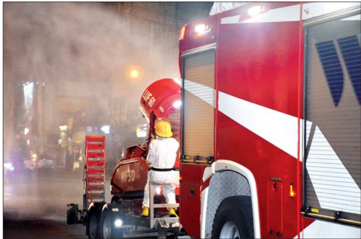
၆-၅-၂၀၂၀ ရက်က ရန်ကုန်တိုင်းဒေသကြီး တောင်ငူဥက္ကလာပမြို့နယ်အတွင်း COVID-19 ကာကွယ်ဆေးဖျန်းစဉ်။