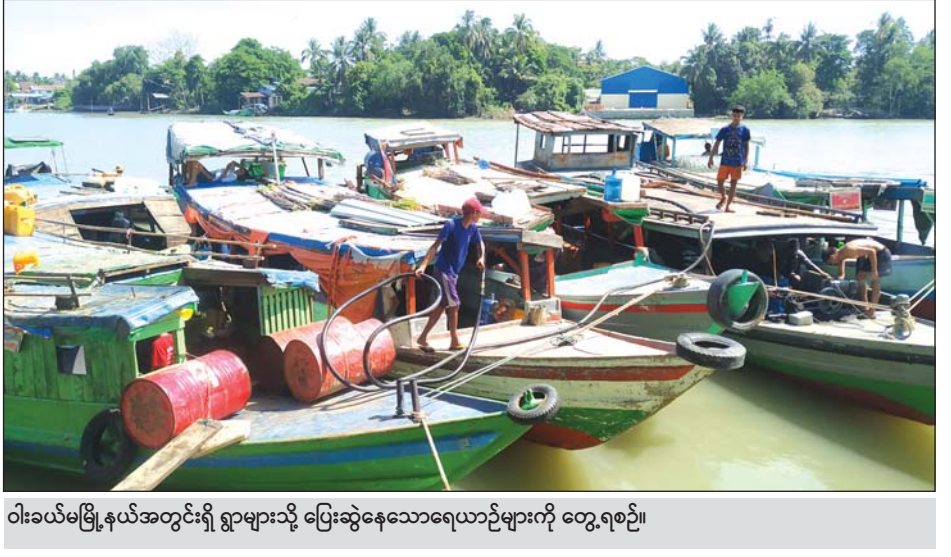
ဝါးခယ်မမြို့နယ်အတွင်းရှိ ရွာများသို့ ပြေးဆွဲနေသောရေယာဉ်များကို တွေ့ရစဉ်။