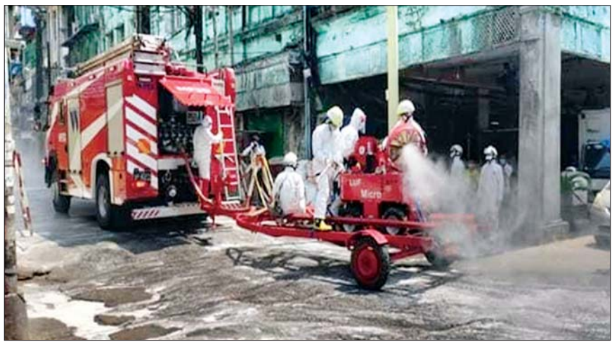
၆-၅-၂၀၂၀ ရက်က ရန်ကုန်တိုင်းဒေသကြီး တောင်ငူဥက္ကလာပမြို့နယ်အတွင်း COVID-19 ကာကွယ်ဆေးဖျန်းစဉ်။