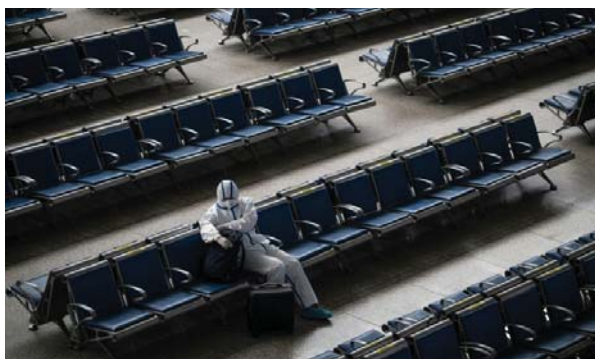
ဂူဟန်မြို့ရှိ ဘူတာရုံတစ်ခု၌ ရထားစောင့်နေသည့် ခရီးသည်တစ်ဦးကို တွေ့ရစဉ်။

အဝန်း ခံစားရလျက်ရှိသည်။ တရုတ်နိုင်ငံ၌ ကိုဗစ်-၁၉ ကူးစက်ခံရသူ အရေအတွက် ၈၂၉၀ ဦးရှိခဲ့ကာ တရားဝင်သေဆုံးသူ အရေအတွက်မှာ ၄၆၃၃ ဦး ဖြစ်သည်။ အာဏာပိုင်များသည် ပြီးခဲ့သည့်မတ်လ နှောင်းပိုင်းတွင် ကပ်ရောဂါဆိုင်ရာ ကန့်သတ်ပိတ်ဆို့မှုများကို စတင်ဖယ်ရှားခဲ့သည်။ အဝင်အထွက် ကန့်သတ်ပိတ်ဆို့မှုများ ဖယ်ရှားလိုက်ပြီး တစ်လ နီးပါးအကြာတွင် ဂူဟန်မြို့၌ ရောဂါကူးစက်ခံရသူ တစ်ဦး ထပ်မံပေါ်ထွက်လာခြင်းဖြစ်ကြောင်း သိရသည်။