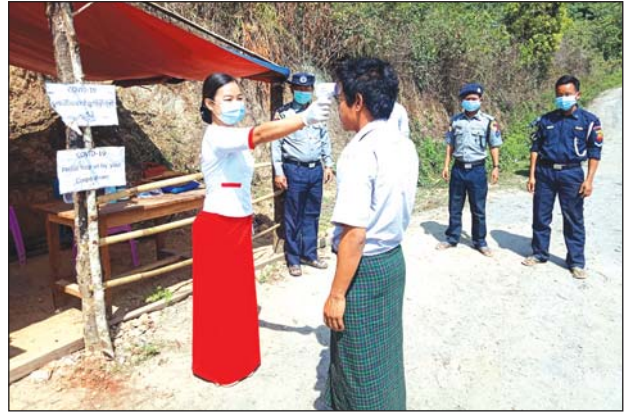
ထန်ပါခွေမြို့၌ ကိုဗစ်-၁၉ ကာကွယ်ရေးအတွက် အပူချိန်တိုင်းစစ်ဆေးစဉ်။