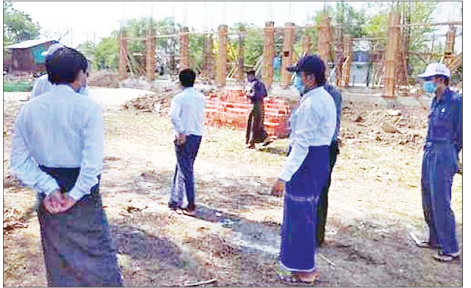
ဒေသဖွံ့ဖြိုးရေးဆောင်ရွက်ထားမှုကို တာဝန်ရှိသူများ စစ်ဆေးစဉ်။

ပြည်ကြီးတံခွန် မြို့နယ်တွင် ရပ်ကွက် ၁၆ ရပ်ကွက်ရှိပြီး အိမ်ခြေ ၃၀၀၂၇ အိမ်နှင့် အိမ်ထောင်စု ၃၆၀၇၁ စု ရှိကြောင်း မြို့နယ် အထွေထွေ အုပ်ချုပ်ရေးဦးစီးဌာန၏ စာရင်းများအရ သိရသည်။ သန်းစော်မင်း(ပြန်/ဆက်)