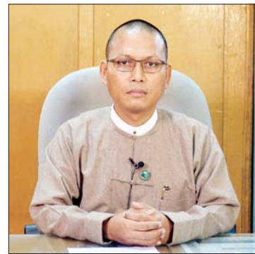
ခေတ္တဦးဆောင်ညွှန်ကြားရေးမှူးချုပ် ဦးကိုကိုနိုင်

စာအုပ်စာစောင် ထုတ်ဝေသည့်လုပ်ငန်း များတွင် ၂၀၂၀-၂၀၂၁ ပညာသင်နှစ်အတွက် အခြေခံပညာကျောင်းသုံးစာအုပ် မူလတန်း၊ အလယ်တန်း၊ အထက်တန်းအတွက် စာအုပ် ခြောက်မျိုးကို အမှာစောင်ရေ ၄၁ ဒသမ ဖြေစ သန်းခန့် ပုံနှိပ်ထုတ်လုပ်ပေးနိုင်ခဲ့သည်။