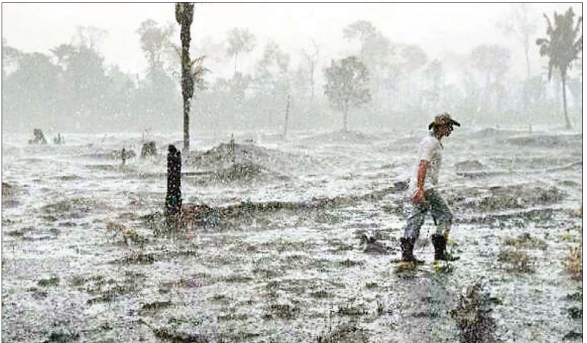
ဘရာဇီးနိုင်ငံရှိ အမေဇုန်သစ်တောပြုန်းတီးမှုအခြေအနေကို တွေ့ရစဉ်။

သမ္မတဂျားလ်ဘော်ဆိုနာရီ တာဝန်စတင် ထမ်းဆောင်တဲ့ ပြီးခဲ့တဲ့နှစ်က ဘရာဇီး အမေဇုန် သစ်တောပြုန်းတီးမှု ၈၅ ရာခိုင်နှုန်းရှိပြီး သစ်တောရဲ့ ၁၀၁၂၄ စတုရန်းကီလိုမီတာ လောက်အထိ ဆုံးရှုံးခဲ့ရပါတယ်။ အဲဒီသစ်တော ပြုန်းတီးမှုဇေရီယာဟာ လက်ဘနွန်နိုင်ငံလောက် အရွယ်အစားရှိတာကြောင့် မိုးသစ်တောရဲ့ အနာဂတ်အခြေအနေနဲ့ ပတ်သက်ပြီး ကမ္ဘာတစ်ဝန်းကို သတိပေးခေါင်းလောင်းမြည်စေခဲ့ပါတယ်။ ဒီကိစ္စက ရာသီဥတုပြောင်းလဲမှုကို ထိန်းချုပ်ရာမှာလည်း အသက်တမ္မာ အရေးကြီး