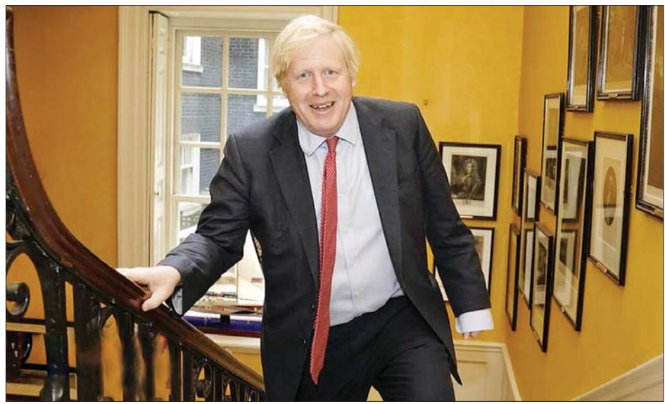
ဗြိတိန်ဝန်ကြီးချုပ် ဘောရစ်ဂျွန်ဆင်

ထို့ပြင် နိုးကြားသတိရှိမှုဖြင့် ဗိုင်းရပ်စ်ကို ထိန်းချုပ်ကာ လူ့အသက် ကယ်ဆယ်ကြပါဖို့ဟူသော ကြွေးကြော်