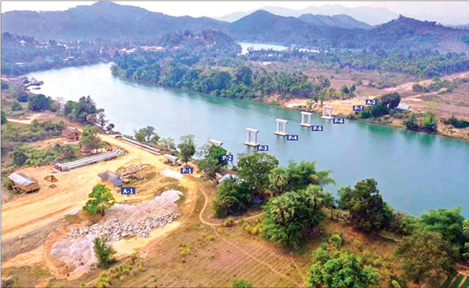
၂၀၁၉-၂၀၂၀ ခု ဘဏ္ဍာရေးနှစ်တွင် တံတားဦးစီးဌာန တည်ဆောက်ရေးအဖွဲ့(၄) က တည်ဆောက်လျက်ရှိသည့် ဗောဓိကမ်းတံတားကို တွေ့ရစဉ်။