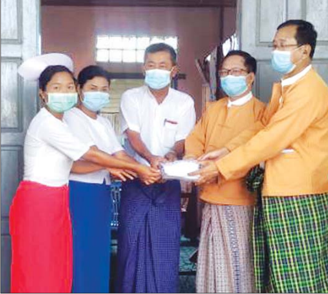
တိုင်းဒေသကြီးဝန်ကြီးများက စောင့်ကြည့်ရေးစခန်းများသို့ အသုံးပြုရန် ထောက်ပံ့ငွေပေးအပ်စဉ်။

ကလေး မေ ၁၀ စစ်ကိုင်းတိုင်းဒေသကြီး ဝန်ကြီးများဖြစ်ကြသော စိုက်ပျိုးရေး၊ မွေးမြူရေးနှင့် ဆည်မြောင်းဝန်ကြီး ဦးကမ်ဇော်နှင့် ချင်းတိုင်းရင်းသားလူမျိုးရေးရာဝန်ကြီး ဦးလာလ်ထောင်ထန်းတို့သည် ကလေးမြို့နယ်အတွင်း ဖွင့်လှစ်ထားရှိသော ကန့်သတ်စောင့်ကြည့်ရေးစခန်းများသို့ မေ ၁၀ ရက်က သွားရောက်စစ်ဆေးခဲ့ကြကြောင်း သိရသည်။ သွားရောက်စစ်ဆေးခဲ့ကြသည့် ကန့်သတ်စောင့်ကြည့်ရေးစခန်းများမှာ အောင်မြေမာန်ရပ်ကွက်တွင် ဖွင့်လှစ်ထားရှိသော အထက-၁၊ စမ်းမြို့ရပ်ကွက်တွင် ဖွင့်လှစ်ထားရှိသော အထက-၈၊ နတ်ကြီးကုန်း(ပုဉ်း)ကျေးရွာ အထက၊ ပုဉ်းခုံကြီးကျေးရွာ အထက(ခွဲ)၊ ပြည်တော်သာ အထက(ခွဲ)၊ အထက လက်ပံချောင်းကျေးရွာ၊ ညောင်ကုန်းကျေးရွာ အထက(ခွဲ)၊ အထက သာစည်ကျေးရွာနှင့် အထက ထောက်ကြွန်းကျေးရွာတို့တွင် ဖွင့်လှစ်ထားရှိသော ကန့်သတ်စောင့်ကြည့်ရေးစခန်းများရှိ စေတနာ့ဝန်ထမ်းအဖွဲ့များ၊ ကန့်သတ်စောင့်ကြည့်ရေးစခန်းဝင်နေသူများကို တွေ့ဆုံကာ ကျန်းမာရေးနှင့် အားကစားဝန်ကြီးဌာန၏ လမ်းညွှန်ချက်များအတိုင်း တိကျစွာ လိုက်နာဆောင်ရွက် နေထိုင်ပေးကြရန် မှာကြားခဲ့သည်။ ထိုသို့ သွားရောက်စစ်ဆေးရာတွင် စောင့်ကြည့်ရေးစခန်းမှူးနှင့် လိုအပ်သည့် နှာခေါင်းစည်းများ၊ လက်သန့်ဆေးရည်ဘူးများနှင့် အထွေထွေ အသုံးစရိတ်အဖြစ် ငွေကျပ် တစ်သိန်းစီကို လှူဒါန်းပေးခဲ့ကြောင်း သိရသည်။ သန့်ထိုက်အောင်(ပြန်/ဆက်)