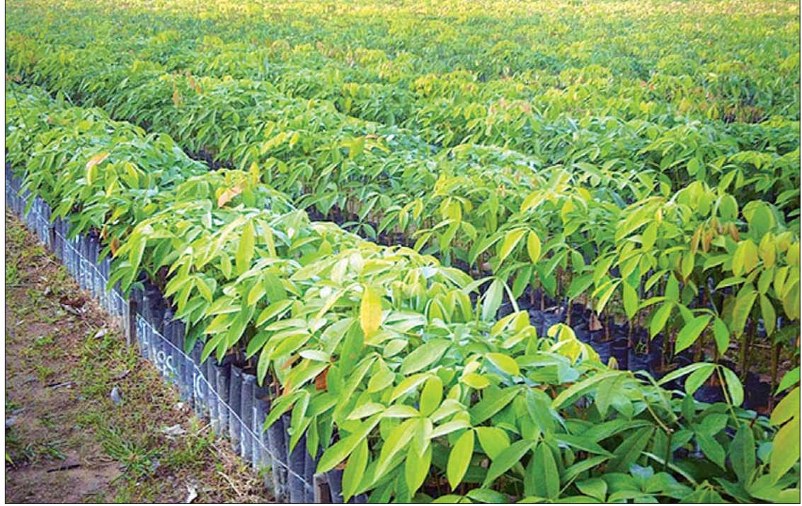
သရက်ချောင်းမြို့နယ်ရှိ ရော်ဘာပျိုးခင်းကို တွေ့ရစဉ်။

နောက်တစ်ခုအနေနဲ့ ဒေသဖွံ့ဖြိုး တိုးတက်ရေးကိစ္စတွေနဲ့ပတ်သက်ပြီး ပိုပြီး စနစ်တကျနဲ့ ဆောင်ရွက်နိုင်အောင်စပြီး စီမံကိန်းမချခင်ကတည်းက သေသေချာချာ စိစစ်ပါတယ်။ ဒေသဖွံ့ဖြိုးရေးနဲ့ ပတ်သက်တဲ့ လုပ်ငန်းတွေမှာ အဓိက ပြည်သူလူထု ပူးပေါင်းပါဝင်မှုရဲ့ အင်အားက အဓိကကျ ပါတယ်။ ပြည်သူလူထု ပူးပေါင်းပါဝင်နိုင်တဲ့ နည်းလမ်းတွေကို ကျွန်တော်တို့က ဖန်တီး ရမှာဖြစ်ပါတယ်။ အစိုးရကောင်းတစ်ရပ်ရဲ့ အောင်အောင်မြင်မြင်နဲ့ ဆောင်ရွက်နိုင်ခြင်း၊ မဆောင်ရွက်နိုင်ခြင်းဆိုတာက ပြည်သူလူထုရဲ့ ပါဝင်မှုအပေါ်မှာ အများကြီးမူတည်တယ်လို့ ကျွန်တော်တို့က ခံယူထားတဲ့အတွက် ပြည်သူ နဲ့ပူးပေါင်းပြီး ဆောင်ရွက်သွားမယ်ဆိုတဲ့ အကြောင်း မြေကြားလိုပါတယ်။ ။