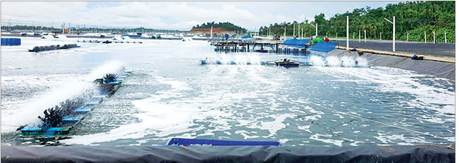
ကျွန်းစုမြို့နယ်အတွင်းရှိ ပြည်မြို့တွင်းကုမ္ပဏီ ရေငန်ပုစွန်မွေးမြူထားရှိမှုကို တွေ့ရစဉ်။