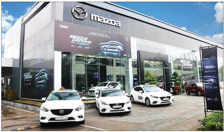
မာဒေဇာ ကားအရောင်းပြခန်းကို တွေ့ရစဉ်။