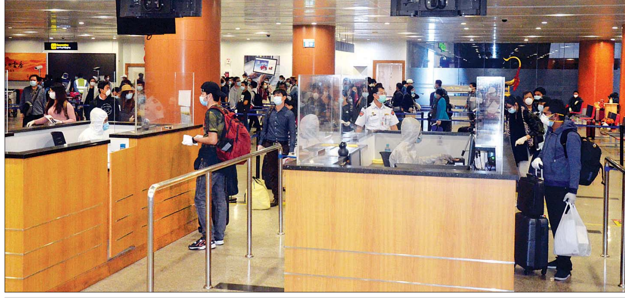
အာရပ်စော်ဘွားများ ပြည်ထောင်စုနိုင်ငံမှ ပြန်ရောက်လာသည့် မြန်မာနိုင်ငံသားများကို ရန်ကုန်အပြည်ပြည်ဆိုင်ရာလေဆိပ်၌ တွေ့ရစဉ်။

“မြန်မာသံရုံးများနှင့် မြန်မာနိုင်ငံရှိ သက်ဆိုင်ရာ ဝန်ကြီးဌာနတို့နှင့် ပူးပေါင်းညှိနှိုင်းဆောင်ရွက်ပေးမှုဖြင့် ဂျပန်နိုင်ငံ၊ အိန္ဒိယနိုင်ငံ၊ ကိုရီးယားသမ္မတနိုင်ငံ၊ ထိုင်းနိုင်ငံ၊ ဘင်္ဂလားဒေ့ရှ်နိုင်ငံ၊ စင်ကာပူနိုင်ငံ၊ အမေရိကန်ပြည်ထောင်စု၊ ဗြိတိန်နိုင်ငံ၊ အင်ဒိုနီးရှားနိုင်ငံနှင့် အာရပ်စော်ဘွားများပြည်ထောင်စုနိုင်ငံ(ယူအေအီး)တို့မှ အခက်အခဲကြုံတွေ့နေရသည့် မြန်မာနိုင်ငံသား စုစုပေါင်း ၁၁၁၃ ဦးအား ကယ်ဆယ်ရေးလေယာဉ်များဖြင့် မြန်မာနိုင်ငံသို့ ပြန်လည်ခေါ်ဆောင်ပေးခဲ့ပြီးဖြစ်”