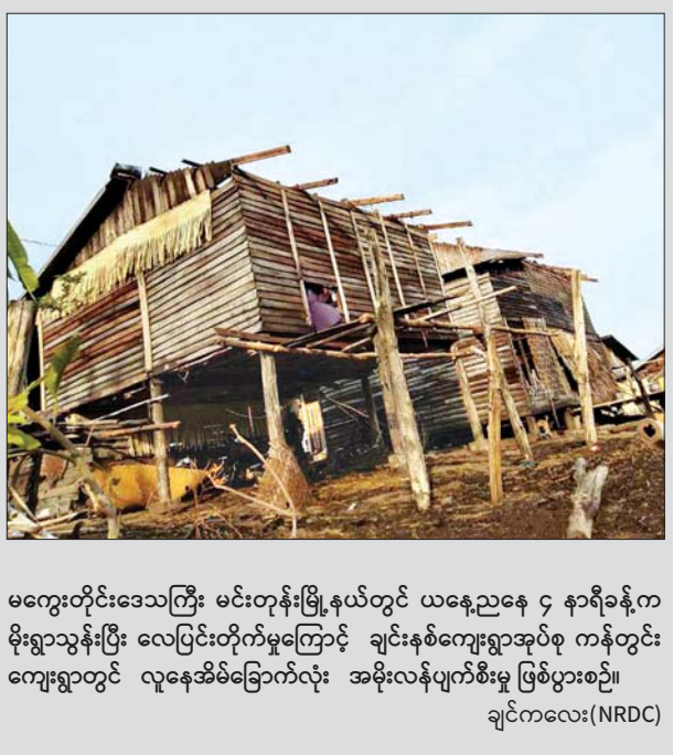
မကွေးတိုင်းဒေသကြီး မင်းတုန်းမြို့နယ်တွင် ယနေ့ညနေ ၄ နာရီခန့်က မိုးရွာသွန်းပြီး လေပြင်းတိုက်မှုကြောင့် ချင်းနစ်ကျေးရွာအုပ်စု ကန်တွင်း ကျေးရွာတွင် လူနေအိမ်ခြောက်လုံး အမိုးလန်ပျက်စီးမှု ဖြစ်ပွားစဉ်။ ချင်ကလေး(NRDC)

ဆိပ်ဖြူ မေ ၁၀ မကွေးတိုင်းဒေသကြီး ဆိပ်ဖြူမြို့နယ် တွင် မေ ၁၀ ရက် မွန်းလွဲ ၁ နာရီ ၁၅ မိနစ်က လေပြင်းတိုက်မှုကြောင့် ကျားဘေးကျေးရွာ အခြေခံပညာ အထက်တန်းကျောင်း(ခွဲ)မှ သရဖီ ကျောင်းဆောင် အမိုးလန်ပျက်စီးခဲ့ သည်။ (ဝဲပုံ) အဆိုပါ လေပြင်းတိုက်မှုကြောင့် ကျားဘေးကျေးရွာ အခြေခံပညာ အထက်တန်းကျောင်း(ခွဲ)မှ သရဖီ ကျောင်းဆောင် တစ်ဆောင်မှ အမိုး သွပ်များလန်ခြင်း၊ မြားတန်း အရောင်း ၃၀ ပျက်စီးခဲ့ကြောင်းနှင့် လူနှင့် တိရစ္ဆာန်များ ထိခိုက်မှုမရှိကြောင်း သိရသည်။ ကိုမျိုး(ယောဇရာ)