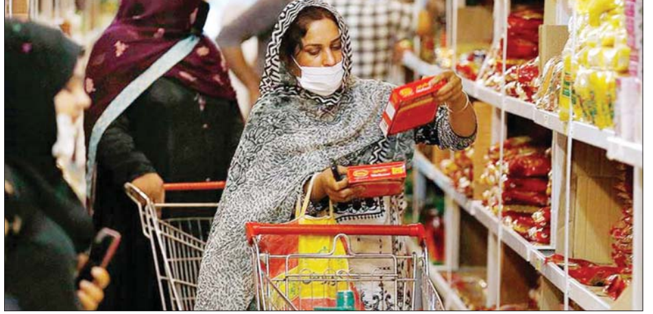
ပါကစ္စတန်နိုင်ငံ အစ္စလာမာဘတ်မြို့ရှိ အစိုးရဖွင့်လှစ်ထားသည့် စုပါမားကတ်တွင် ဝယ်ယူနေကြသူများကို တွေ့ရစဉ်။