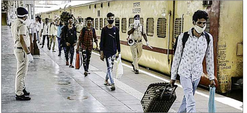
အိန္ဒိယနိုင်ငံမှ ရွှေ့ပြောင်းလုပ်သားများကို တွေ့ရစဉ်။

မတ် ၂၅ ရက်တွင် ကြေညာခဲ့သည့် ကန့်သတ်ပိတ်ဆို့ မှုကို ပြီးခဲ့သည့် ရက်သတ္တပတ်က ဒုတိယအကြိမ်အဖြစ် မေ ၁၇ ရက်အထိ အချိန်ထပ်တိုးထားကြောင်း သိရသည်။ ဆင်ဟွာ