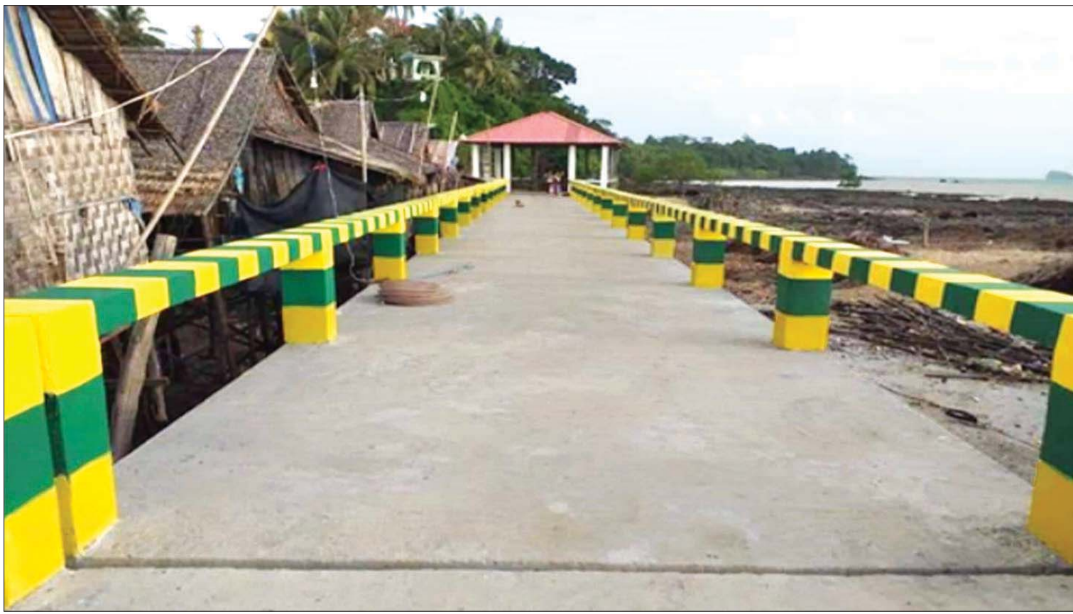
၂၀၁၈-၂၀၁၉ ဘဏ္ဍာရေးနှစ် ကော့သောင်းမြို့နယ် အောင်မြန်မာကျေးရွာ ရေဆင်းဆိပ်ခံ ပေ ၄၀၀ တံတားတည်ဆောက်ထားမှုကို တွေ့ရစဉ်။

လယ်ယာမြေနဲ့ ပတ်သက်ပြီး လယ်ယာ မြေပုံစံ (၇) ကို စနစ်တကျနဲ့ ပေးအပ်နေပါ တယ်။ ရာခိုင်နှုန်း တော်တော်များများက ပုံစံ(၇) တွေကို ပေးအပ်ပြီးဖြစ်ပါတယ်။