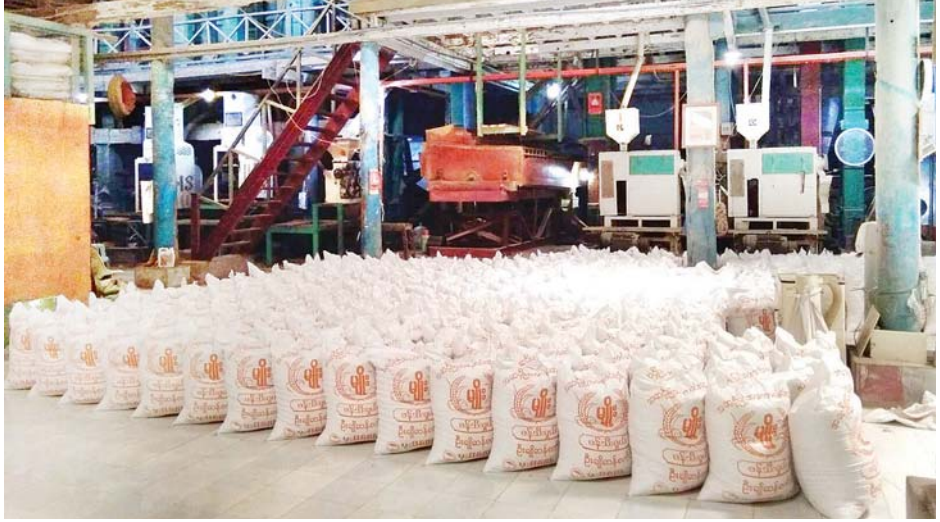
ပုသိမ်မြို့ရှိ ဆန်စက်တစ်ခုကို တွေ့ရစဉ်။

ဆန်စက်လုပ်ငန်းရှင်များအနေဖြင့် ရန်ကုန်၊ မကွေး၊ မန္တလေး၊ စစ်ကိုင်းတိုင်းဒေသကြီးများအတွင်းရှိ မြို့နယ်များသို့ ဆန်အများဆုံး တင်ပို့လျက်ရှိပြီး ယခုလက်ရှိ ဆန်တစ်အိတ်လျှင် ပုသိမ် ဧရာဝတီပေါ်ဆန်းမွေး ငွေကျပ် ၄၀၀၀၀၊ ပုသိမ်ပေါ်ဆန်းရင် ငွေကျပ် ၃၆၀၀၀၊ သီးထပ်ရင် ငွေကျပ် ၂၃၀၀၀၊ မနောသုခ ငွေကျပ် ၂၈၀၀၀၊ ရက် ၉၀ ဆန် ငွေကျပ် ၂၄၅၀၀ ဖြစ်ကြောင်း သိရသည်။ ကိုတွတ် (ပြန်/ဆက်)