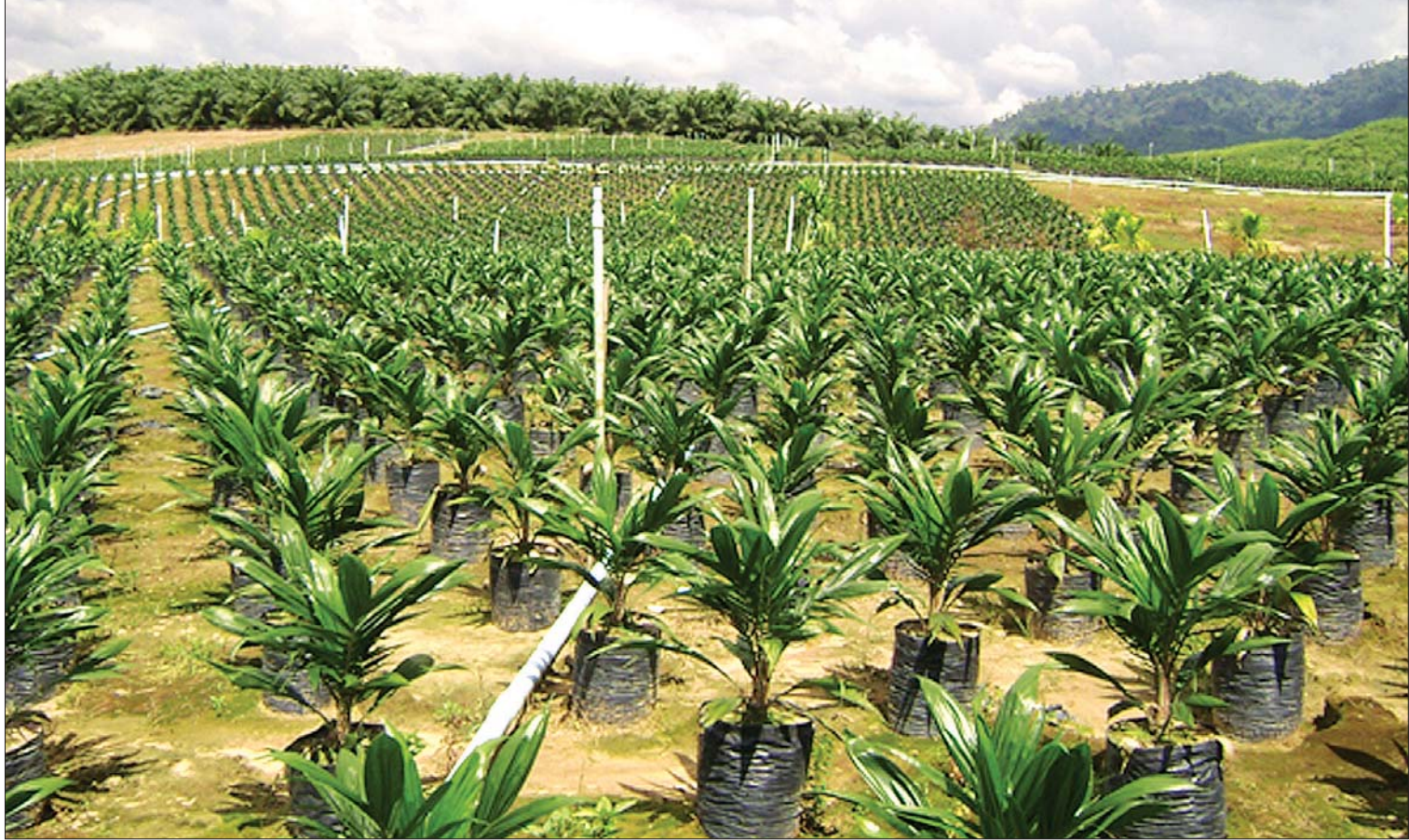
သရက်ချောင်းမြို့နယ်ရှိ ဆီအုန်းပျိုးခင်းကို တွေ့ရစဉ်။

“တိုင်းဒေသကြီးအစိုးရအဖွဲ့အနေနဲ့ နှစ်အလိုက် တစ်နှစ် ကို ငွေကျပ်သိန်း ၁၀၀၀ နဲ့ ဆလုံလူမျိုးတွေအတွက် ပညာရေးနဲ့ ကျန်းမာရေးပြီးရင် သူတို့ရဲ့ စားဝတ်နေရေး အတွက် တတ်နိုင်တဲ့ဘက်ကနေပြီး အကောင်းဆုံးဖြစ်အောင် ဆောင်ရွက်မယ်ဆိုပြီး ဆုံးဖြတ်ချက်တွေချပြီး တိုင်းဒေသ ကြီးအစိုးရအဖွဲ့က ထောက်ပံ့ခဲ့ပါတယ်။ ပထမဦးဆုံး လိုအပ်ချက်ဖြစ်တဲ့ စားဝတ်နေရေးကိစ္စတွေအတွက် ဆန်၊ အသက်မွေးဝမ်းကျောင်းလုပ်တဲ့ ရေလုပ်ငန်းအတွက် ငါးမျှားတံတို့၊ လှေငယ်လေးတွေကို အဓိကထားဖြည့်ဆည်း ပေးပါတယ်”