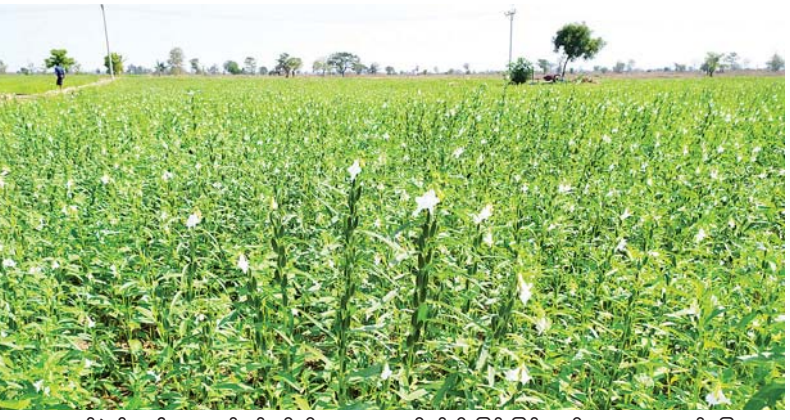
ကျရောက်ခဲ့၍ စပါးအထွက်နှုန်းသိသာသာ လျော့ကျကာ တောင်သူများ အရှုံးပေါ်ခဲ့သော်လည်း တောင်သူများက ယခုနှစ်နွေနှမ်း

စစ်ကိုင်းတိုင်းဒေသကြီး ဒီပဲယင်းမြို့နယ်သည် သမန်းဆိပ်ဆည်ရေနည်းပါးမှုကြောင့် နွေစပါးစိုက်ပျိုးရေးပေးဝေမှု မရှိသဖြင့် နွေစပါးအစား နွေနှမ်းများကို မြေအောက်ရေဖြင့် စိုက်ပျိုးကြသည်။