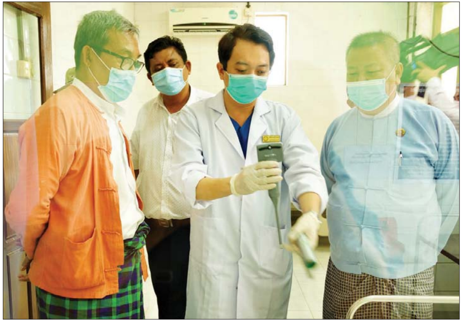
ပြည်နယ်ဝန်ကြီးချုပ် ဦးညီပု ကိုဗစ် - ၁၉ ကြိုတင်ကာကွယ်ရေးလုပ်ငန်းဆောင်ရွက်မှု ကြည့်ရှုစစ်ဆေးစဉ်။

ထို့နောက် မြို့နယ် ကိုဗစ်-၁၉ ထိန်းချုပ်ရေးနှင့် အရေးပေါ်တုံ့ပြန် ရေးကော်မတီဥက္ကဋ္ဌ ဦးကျော်ဆန်း ကျော်နှင့် လုပ်ငန်းဆောင်ရွက်မတီ ဥက္ကဋ္ဌများက မြို့နယ်အတွင်း ကိုဗစ် - ၁၉ ကြိုတင်ကာကွယ် ထိန်းချုပ်ရေးလုပ်ငန်းများ ဆောင် ရွက်နေမှုများနှင့် မြို့နယ်အတွက် လိုအပ်ချက်များကို ရှင်းလင်းတင်ပြ ကြသည်။ ထို့နောက် ပြည်နယ်ဝန်ကြီးချုပ် နှင့် ပြည်နယ်ဝန်ကြီးများက မြို့နယ် ကော်မတီသို့ ရောဂါကာကွယ်ရေး ဝတ်စုံ ၁၅၀၊ လက်သန့်ဆေးရည် ၅၀၀ မီလီ ၅၅ ဘူး၊ ၆၀ မီလီ ၃၃ ဘူး၊ ဆေးရုံသုံး တစ်ခါသုံးဦးထုပ် ၂၀၀၀၊ နှာခေါင်းစည်း ၄၆၀၀ ၊ အပူချိန်တိုင်း