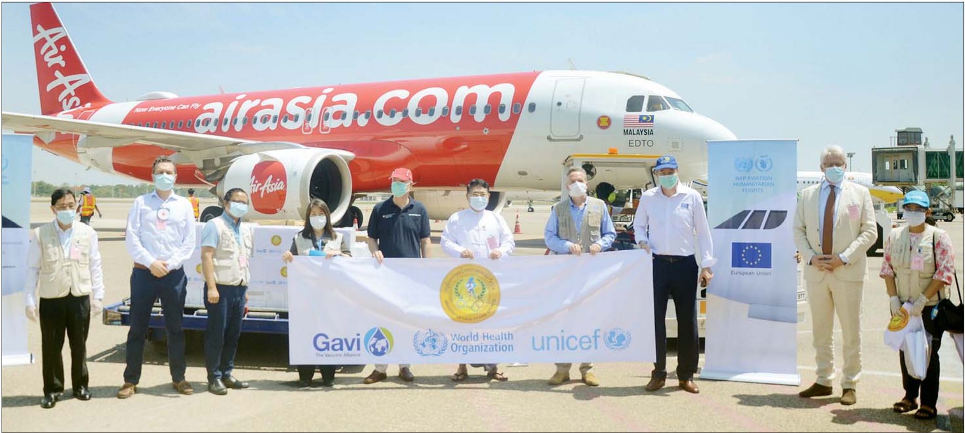
UNICEF ၏အစီအစဉ်ဖြင့် ဝယ်ယူထားသော ကိုဗစ်-၁၉ ရောဂါပိုးစမ်းသပ်ပစ္စည်း (test kits) နှင့် ဆက်စပ်ပစ္စည်းများကို ကျန်းမာရေးနှင့် အားကစားဝန်ကြီးဌာနသို့ လွှဲပြောင်းပေးအပ်စဉ်။

ရန်ကုန် မေ ၁၀ ကိုဗစ်-၁၉ ရောဂါ ကာကွယ်ရေးနှင့် ထိန်းချုပ်ရေးလုပ်ငန်းများ ဆောင်ရွက် ရာတွင် အသုံးပြုရန်အတွက် Global Alliance for Vaccines and Immunization (Gavi) အဖွဲ့၏ ထောက်ပံ့မှုဖြင့် ကုလသမဂ္ဂကလေးများ ရန်ပုံငွေအဖွဲ့ (UNICEF) ၏ အစီအစဉ်ဖြင့် ဝယ်ယူထားသော ကိုဗစ်-၁၉ ရောဂါပိုး စမ်းသပ် ပစ္စည်း (test kits) နှင့် ဆက်စပ်ပစ္စည်းများ ထောက်ပံ့ကူညီပေးသည့်အစီအစဉ် ကို ယနေ့နံနက်ပိုင်းက ရန်ကုန်အပြည်ပြည်ဆိုင်ရာလေဆိပ်၌ ပြုလုပ်သည်။ ကိုဗစ်-၁၉ ရောဂါ ကာကွယ်ရေးနှင့် ထိန်းချုပ်ရေးလုပ်ငန်းများ၏ အစိတ် အပိုင်းတစ်ရပ်အဖြစ် နိုင်ငံတကာလေကြောင်းခရီးစဉ်များကို ယာယီရပ်ဆိုင်း ထားသည့်အတွက် မြန်မာနိုင်ငံရှိ ကုလသမဂ္ဂ၏ကိုယ်စား ကမ္ဘာ့စားနပ်ရိက္ခာ အစီအစဉ် (WFP) က လူသားချင်းစာနာထောက်ထားမှုဆိုင်ရာ အကူအညီပေးရေး ပစ္စည်းများ စာမျက်နှာ ၄ ကော်လံ ၁ ၀