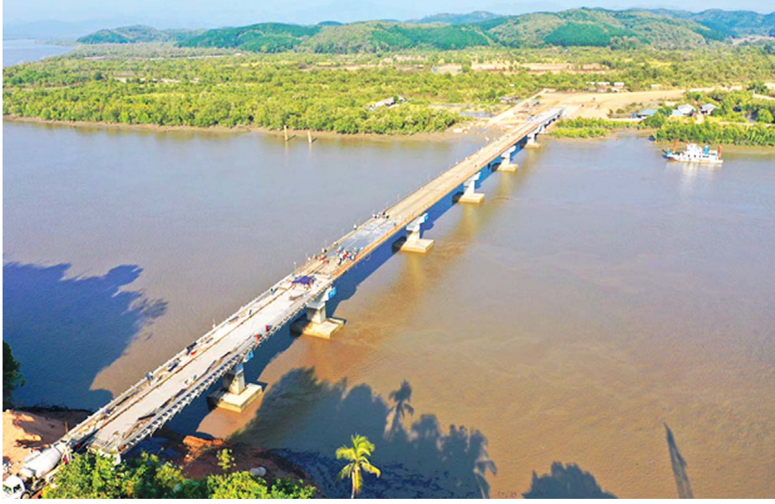
၂၀၁၉-၂၀၂၀ ခု ဘဏ္ဍာရေးနှစ်တွင် တံတားဦးစီးဌာန တည်ဆောက်ရေးအဖွဲ့(၄)မှ တည်ဆောက်လျက်ရှိသည့် သမုတ်-လွတ်လွတ်တံတားကို တွေ့ရစဉ်။

“၂၀၁၉ - ၂၀၂၀ မှာ အဓိကတံတားကြီး သုံးစင်း ဖြစ်တဲ့ သမုတ်-လွတ်လွတ် တံတား၊ တနင်္သာရီတံတားနဲ့ ပုလဲတုံတုံးတံတားတွေ အသစ်ပြန်လည် တည်ဆောက်နေတာ ရှိပါတယ်။ ဒီတံတားကြီးတွေ ပြီးသွားပြီဆိုရင် အချိန်တိုအတွင်း ထားဝယ်ကနေ မြိတ်နဲ့ ကော့သောင်းတို့ကို သွားလာနိုင်မှာ ဖြစ်ပါတယ်။”