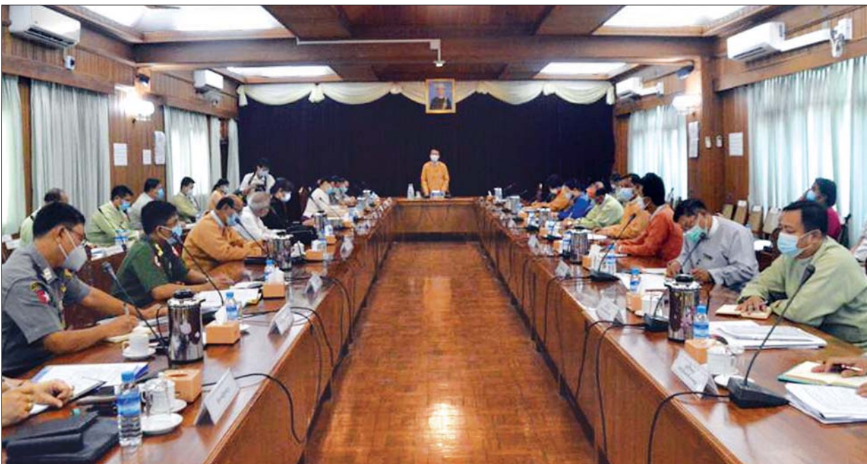
ပြည်ပနိုင်ငံများမှ ပြန်လည်ရောက်ရှိလာသူများကို ၂၁ ရက် အသွားအလာ စောင့်ကြည့်ထားရှိမှု အခြေအနေများ၊ စေတနာ့ဝန်ထမ်းများ၏ ပူးပေါင်း ဆောင်ရွက်မှုများကို ရှင်းလင်းတင်ပြသည်။ ထို့နောက် တက်ရောက်လာသော တိုင်းဒေသကြီးဝန်ကြီးများ၊ ကော်မတီ ဝင်များနှင့်လွှတ်တော်ကိုယ်စားလှယ်များက ဝိုင်းဝန်းဆွေးနွေးခဲ့ကြသည်။ ဆန်းကျော်ဦး (ပြန်/ဆက်)

ထို့နောက် တိုင်းဒေသကြီး ပြည်သူ့ကျန်းမာရေးနှင့် ကုသရေးဦးစီးဌာနမှ ဒုတိယညွှန်ကြားရေးမှူးချုပ် ဒေါက်တာထွန်းမြင့်က တိုင်းဒေသကြီးအတွင်း ကိုဗစ် - ၁၉ ရောဂါ ကာကွယ်၊ ထိန်းချုပ်၊ ကုသရေးလုပ်ငန်းများကို အရှိန်အဟုန် မြှင့်ဆောင်ရွက်နေမှုများ၊ အချို့သောစက်ရုံ၊ အလုပ်ရုံများကို သေချာစွာ သွားရောက်စစ်ဆေးပြီး ကျန်းမာရေးနှင့် အားကစားဝန်ကြီးဌာန၏ သတ်မှတ် ချက်များနှင့်အညီ လုပ်ငန်းခွင်ဝင်ရောက်နေမှုများ၊ မြို့နယ်ကျန်းမာရေးဌာန များ၏ လိုအပ်ချက်များကို ဖြည့်ဆည်းဆောင်ရွက်ပေးနေမှုအခြေအနေ၊