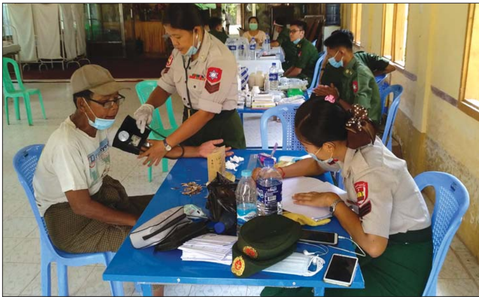
ကျောက်ကြီးမြို့ ဖျားနာ အခမဲ့ ဆေးကုခန်း၌ ကျန်းမာရေးစောင့်ရှောက်မှုဆောင်ရွက်ပေးစဉ်။