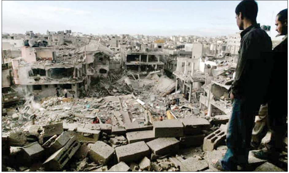
ဂါဇာကမ်းခြေဒေသရှိ အဆောက်အအုံပျက်များကို တွေ့ရစဉ်။