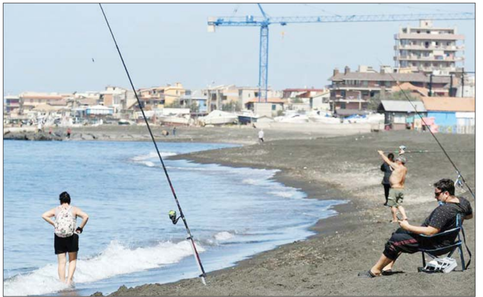
အီတလီနိုင်ငံ ရောမမြို့အနီး ကမ်းခြေတစ်ခုတွင် အပန်းဖြေနေကြသူများကို မေ ၉ ရက်က တွေ့ရစဉ်။