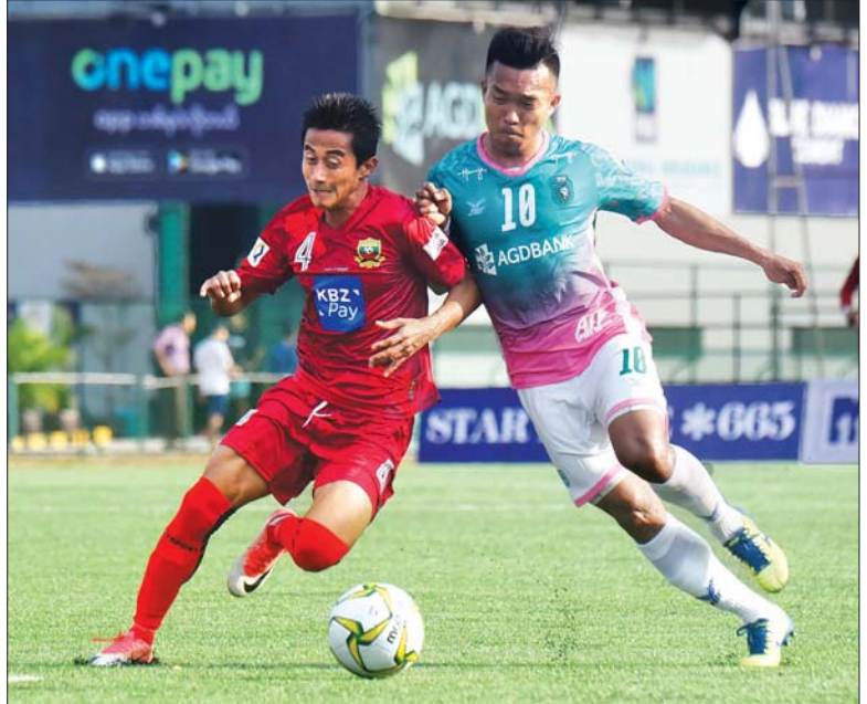
၂၀၂၀ ရာသီ MNL ပွဲစဉ်တစ်ခုကိုတွေ့ရစဉ်။