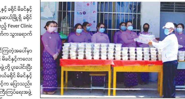
ကြက်ဆီထမင်း၊ အချိုရည်ဘူး၊ ရေသန့်ဘူး၊ နှာခေါင်းစည်းများနှင့် တစ်ရှူးထုပ်များကို ထောက်ပံ့ပေးအပ် လှူဒါန်းခဲ့သည်။

မူဆယ် မေ ၁၀ ရှမ်းပြည်နယ်(မြောက်ပိုင်း) မူဆယ်ခရိုင် အမျိုးသမီးရေးရာအဖွဲ့နှင့် ခရိုင် မိခင်နှင့် ကလေးစောင့်ရှောက်မှု ကြီးကြပ်ရေးအဖွဲ့တို့ ပူးပေါင်းပြီး မူဆယ်မြို့ရှိ ခရိုင် မိခင်နှင့်ကလေးစောင့်ရှောက်ရေးအသင်းရုံး၌ ဖွင့်လှစ်ထားသည့် Fever Clinic ဆေးခန်းသို့ PPE ဝတ်စုံ ၂၀ နှင့် စားနပ်ရိက္ခာများကို မေ ၁၀ ရက်က သွားရောက် လှူဒါန်းသည်။ "အမျိုးသမီးတွေအချင်းချင်း လုပ်ငန်းအတူတူ လုပ်ကိုင်ကြတဲ့အပေါ်မှာ အမျိုးသမီးတွေ ဖွံ့ဖြိုးတိုးတက်ရေးကို မျှော်မှန်းပြီးတော့ ခရိုင် မိခင်နှင့်ကလေးစောင့်ရှောက်မှု ကြီးကြပ်ရေးအဖွဲ့နှင့် ခရိုင်အမျိုးသမီးရေးရာအဖွဲ့တို့ ပူးပေါင်းပြီး အခုလို လှူဒါန်းနိုင်တဲ့အတွက် ဝမ်းမြောက်မိပါတယ်"ဟု မူဆယ်ခရိုင် မိခင်နှင့် ကလေးစောင့်ရှောက်မှုကြီးကြပ်ရေးအဖွဲ့ ဥက္ကဋ္ဌ ဒေါ်မိုးသူတင်က ပြောသည်။ ထို့နောက် မူဆယ်ခရိုင် မိခင်နှင့်ကလေး စောင့်ရှောက်မှုကြီးကြပ်ရေးအဖွဲ့ ဥက္ကဋ္ဌနှင့် အဖွဲ့ဝင်များသည် တရုတ်နိုင်ငံမှ ပြန်လည်ဝင်ရောက်လာသူများအား ယာယီ အသွားအလာကန့်သတ်၍ စောင့်ကြည့်နေသော နေရာများဖြစ်သည့် မူဆယ်မြို့ အထက(၃)ကျောင်းနှင့် တရုတ်စာသင်ကျောင်းတို့ရှိ တရုတ်နိုင်ငံမှ နေရပ်ပြန် စုစုပေါင်း ၃၀၀ ကျော်အတွက် စားနပ်ရိက္ခာများကို သွားရောက် လှူဒါန်းပြီး ၎င်းတို့၏ လူမှုရေးအခက်အခဲများနှင့်ပတ်သက်၍ အားပေးနှစ်သိမ့် စကားများ ပြောကြားခဲ့သည်။ ထို့နောက် ခရိုင်အုပ်ချုပ်ရေးမှူး ဦးလှိုင်စိုးသန့်နှင့် ဌာနဆိုင်ရာများ၊ ခရိုင် မိခင်နှင့်ကလေးစောင့်ရှောက်မှု ကြီးကြပ်ရေးအဖွဲ့နှင့် ခရိုင်အမျိုးသမီးရေးရာအဖွဲ့တို့မှ တာဝန်ရှိသူများက ပြည်ပမှ ပြန်လာသူများအား