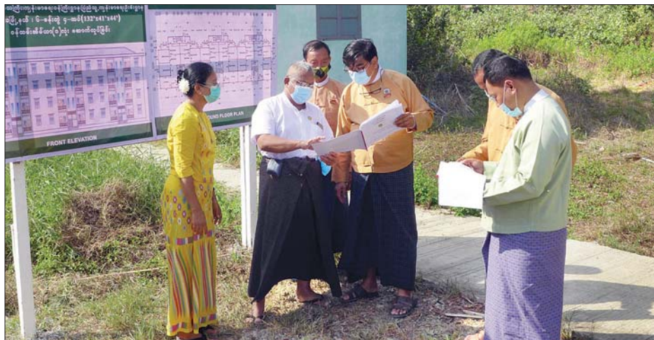
ဝန်ထမ်းအိမ်ရာ တည်ဆောက်ရေးအတွက် ပုံစံငယ်ကို ရှင်းလင်းတင်ပြစဉ်။

ရန်ကုန် မေ ၁၀ ရန်ကုန်တိုင်းဒေသကြီး ဒလမြို့နယ် ပြည်သူ့ဆေးရုံ၌ ၂၀၁၈-၂၀၁၉ ဘဏ္ဍာနှစ်တွင် တည်ဆောက်လျက်ရှိသည့် လေးခန်းတွဲ လေးထပ် ဝန်ထမ်းအိမ်ရာ အဆောက်အအုံသစ် တည်ဆောက်မှု ၉၀ ရာခိုင်နှုန်းဆောင်ရွက်ပြီးစီး လျက်ရှိပြီး ၂၀၁၉-၂၀၂၀ ဘဏ္ဍာနှစ် ခြောက်ခန်းတွဲ လေးထပ်ဝန်ထမ်း အိမ်ရာတစ်လုံး အသစ်ထပ်မံ တည်ဆောက်ရေးအတွက် ပန္နက်တင် မင်္ဂလာအခမ်းအနားကို ယမန်နေ့က အဆိုပါ ဆေးရုံဝင်းအတွင်း ကျင်းပ သည်။