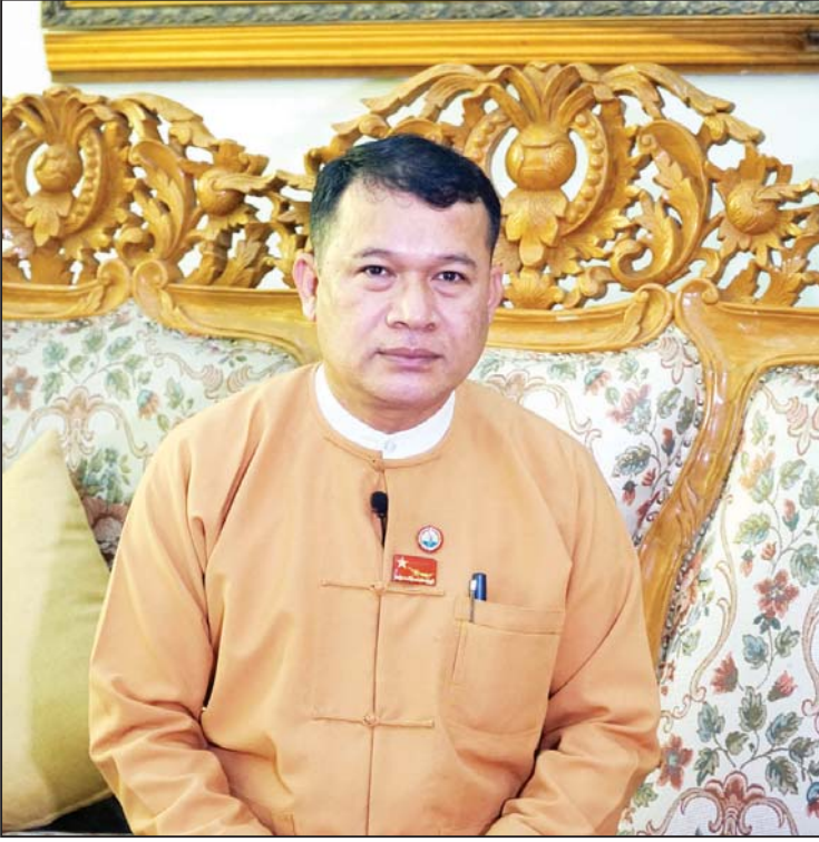
တနင်္သာရီတိုင်းဒေသကြီး ဝန်ကြီးချုပ် ဦးမြင့်မောင်။

“၂၀၁၉ - ၂၀၂၀ မှာ အဓိကတံတားကြီး သုံးစင်း ဖြစ်တဲ့ သမုတ်-လွတ်လွတ် တံတား၊ တနင်္သာရီတံတားနဲ့ ပုလဲတုံတုံးတံတားတွေ အသစ်ပြန်လည် တည်ဆောက်နေတာ ရှိပါတယ်။ ဒီတံတားကြီးတွေ ပြီးသွားပြီဆိုရင် အချိန်တိုအတွင်း ထားဝယ်ကနေ မြိတ်နဲ့ ကော့သောင်းတို့ကို သွားလာနိုင်မှာ ဖြစ်ပါတယ်။”