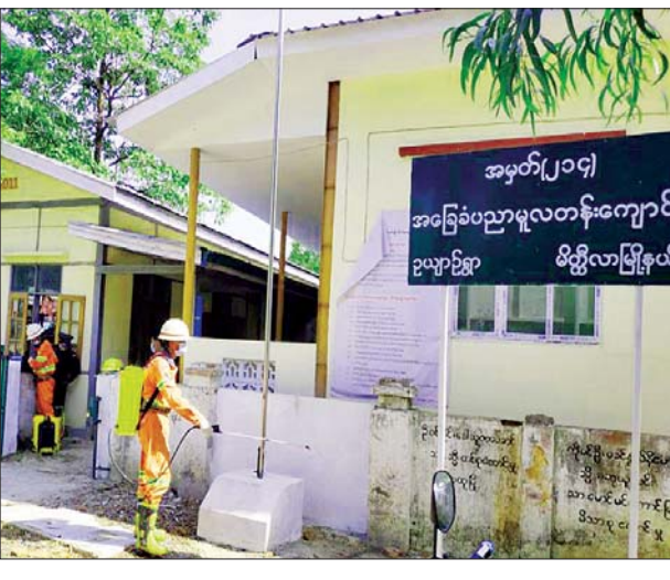
အသွားအလာကန့်သတ်နေရာများအား ပိုးသတ်ဆေးဖျန်းပေးစဉ်။