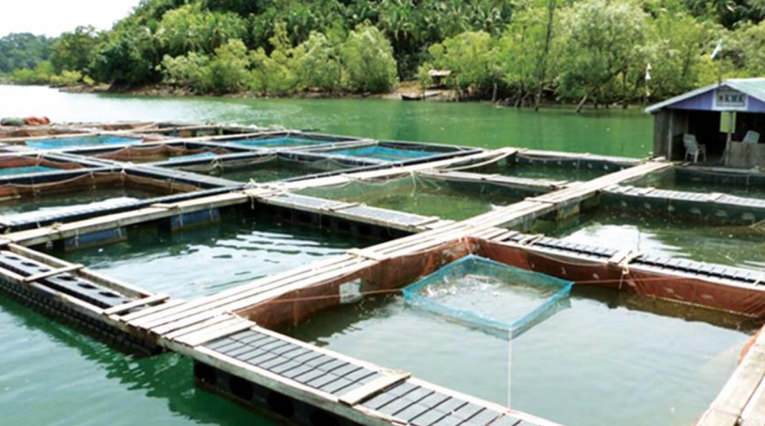
ကျွန်းစုမြို့နယ်အတွင်းရှိ KMK ကုမ္ပဏီမှ ကကတစ်ငါး မွေးမြူထားရှိမှုကို တွေ့ရစဉ်။

မီး ၂၀၂၁ ခုနှစ်မှာ စတင်နိုင်မယ်လို့ ခန့်မှန်း ရပါတယ်။ ဒီမှာ ADB ရဲ့ချေးငွေနဲ့ ဆောင်ရွက် မယ်လို့ သိရပါတယ်။ အဓိက လမ်းနဲ့ လျှပ်စစ်မီး လုံလုံလောက်လောက်ရပြီးမှသာ ရေနက်ဆိပ်ကမ်းကို ရင်းနှီးမြှုပ်နှံသူတွေက ပိုပြီးစိတ်ဝင်တစားနဲ့ လာရောက်ရင်းနှီးမြှုပ်နှံ