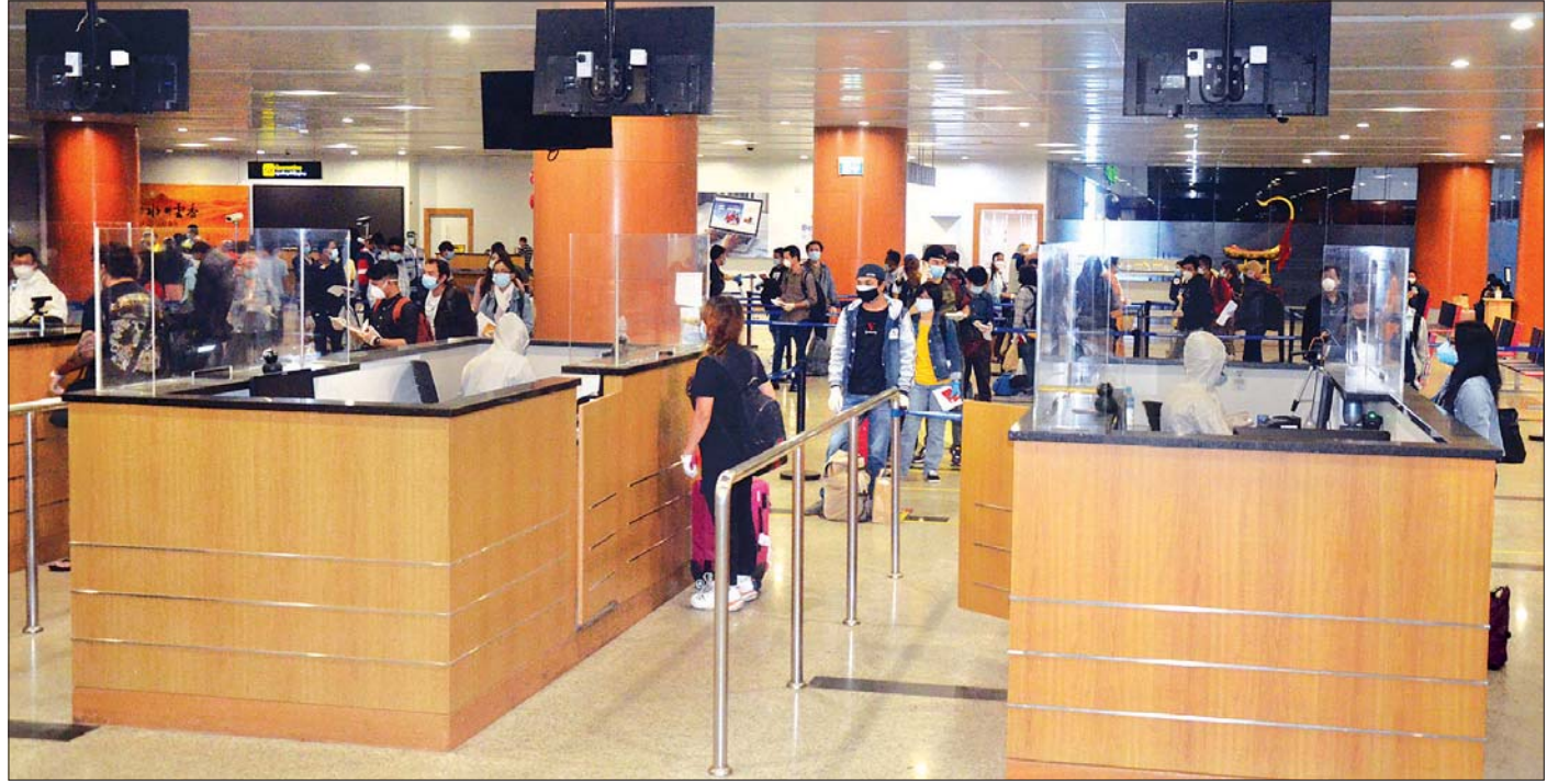
အာရပ်စော်ဘွားများ ပြည်ထောင်စုနိုင်ငံမှ ပြန်ရောက်လာသည့် မြန်မာနိုင်ငံသားများကို ရန်ကုန်အပြည်ပြည်ဆိုင်ရာလေဆိပ်၌ တွေ့ရစဉ်။