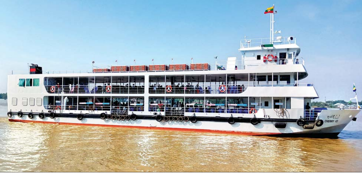
ပြုပြင်ဆောင်ရွက်ပြီး ပြန်လည်ပြေးဆွဲနေသည့် ချယ်ရီ(၂) ရေယာဉ်ကို တွေ့ရစဉ်။

ရန်ကုန် မေ ၁၀ ဒလဆိပ်ကမ်းကို အတည်ပြု၍ ရန်ကုန်ဘက် ပန်းဆိုးတန်းဆိပ်ကမ်း နှင့် နေ့စဉ်သတ်မှတ်ချိန် သတ်မှတ် ခေါက်ရေအလိုက် ပုံမှန်ပြေးဆွဲနေ သည့် ခရီးသည်တင် ချယ်ရီရေယာဉ် သုံးစင်းကို ရန်ကုန်အရှေ့ပိုင်းခရိုင် ဒဂုံမြို့သစ်(ဆိပ်ကမ်း)မြို့နယ် ပဲခူး မြစ်ကမ်းရှိ ပြည်တွင်းရေကြောင်း ပို့ဆောင်ရေး၊ ဒဂုံ-သင်္ဘောကျင်း၌ ရေယာဉ်ကိုယ်ထည် ကြံ့ခိုင်ရေး အတွက် ထိန်းသိမ်းပြုပြင်ခြင်းလုပ်ငန်း များကို အလှည့်ကျ ဒေါက်ကျင်းတင် ကာ ဆောင်ရွက်လျက်ရှိကြောင်း သိရသည်။ ချယ်ရီရေယာဉ်များသည် ဒဂုံ သင်္ဘောကျင်းသို့သွားရန် သန်လျင် တံတားနှင့် မလှတကင်းသည့် ရေယာဉ်အပေါ်ဆုံးထပ် ရေယာဉ်မျိုး အခန်း၏ အမိုးပေါ်ရှိ အချက်ပြမီး နှင့် အလံတိုင်ကိုဖြုတ်ပြီးမှ ခုတ်မောင်း ဖြတ်သန်းရသဖြင့် ချယ်ရီ(၃) ရေယာဉ် သည် မေ ၈ ရက်က အဆိုပါအလံတိုင် အား ဖြုတ်ပြီး မေ ၉ ရက်တွင် ဒဂုံ သင်္ဘောကျင်းသို့ ရောက်ရှိပြန်ခဲ့ ကြောင်း သိရသည်။ အလားတူ ချယ်ရီ (၂) ရေယာဉ်ကို ဧပြီ ၂၃ ရက်မှ မေ ၇ ရက်အတွင်း ကိုယ်ထည်ထိန်းသိမ်း ပြုပြင်ဆောင် ရွက်ခဲ့ပြီး မေ ၈ ရက်က စတင်၍