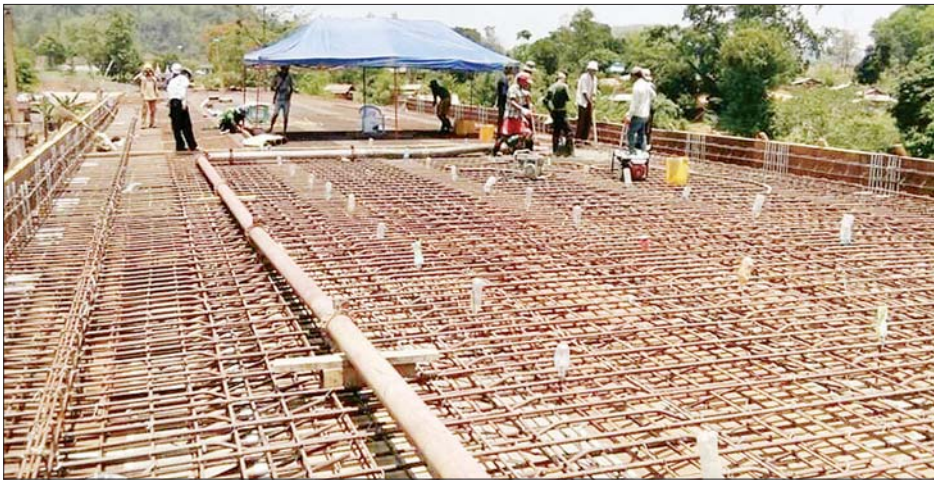
မိုင်းရှူးမြို့ နမ့်ပန်ချောင်းကူးတံတား တည်ဆောက်နေမှုကို တွေ့ရစဉ်။

လုပ်ငန်း၏ ခန့်မှန်းတန်ဖိုးမှာ (ချဉ်းကပ်လမ်းအပါအဝင်) ငွေကျပ်သန်း ၃၃၀၀ ဒသမ ၀၀၀ ကုန်ကျခံဆောက်လုပ်ခြင်းဖြစ်ကြောင်းသိရပြီး တံတားသစ်၏အရှည်မှာ ၃၃၀ မီတာ၊ ယာဉ်သွားလမ်း အကျယ် ၈ ဒသမ ၅ မီတာ၊ လူသွားလမ်းတစ်ဖက် ၁ ဒသမ ၀ မီတာရှိပြီး တံတားအမျိုးအစားမှာ သံကွက်ကွက်ရစ်တံတားဖြစ်ကာ ၇၅ တန် (ယာဉ်တစ်စီးချင်း)ဖြတ်သန်းနိုင်မည်ဖြစ်သည်။ လက်ရှိအသုံးပြုသည့် နမ့်ပန်ချောင်းတံတား(မိုင်းရှူးကြိုးတံတား)သည် နှစ်ကာလကြာမြင့်လာသည်နှင့်အမျှ ရာသီဥတုဒဏ်များကြောင့် ရေရှည်တွင် ကုန်စည် စီးဆင်းမှုများ နှောင့်နှေးမှုများဖြစ်လာနိုင်သဖြင့် တံတားသစ် တည်ဆောက်ရေးကို ဆောင်ရွက်ခဲ့ခြင်းဖြစ်ကြောင်း သိရသည်။ စိန်လှိုင်(ပြန်/ဆက်)