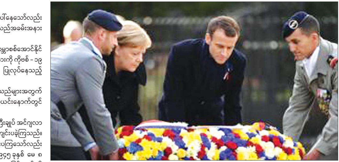
၂၀၁၈ ခုနှစ်က ကျင်းပသည့် ဒုတိယကမ္ဘာစစ်အောင်မြင်ခြင်းနှစ်ပတ်လည်အခမ်းအနား တက်ရောက်လာသော ပြင်သစ် သမ္မတနှင့် ဂျာမနီဝန်ကြီးချုပ်တို့ကို တွေ့ရစဉ်။

ဥရောပတွင် ကိုဗစ် - ၁၉ ကြောင့် ပျက်စီးဆုံးရှုံးမှုများ ဖြစ်ပေါ်နေသော်လည်း ဒုတိယကမ္ဘာစစ်အောင်မြင်သည့် (၇၅) နှစ်မြောက် နှစ်ပတ်လည်အခမ်းအနား ပြုလုပ်ခဲ့သည်။ ဥရောပတစ်လွှား ခေါင်းဆောင်များသည် ဒုတိယကမ္ဘာစစ်အောင်နိုင် ခြင်း (၇၅) နှစ်မြောက် နှစ်ပတ်လည်နေ့အတွက် အခမ်းအနားကို ကိုဗစ် - ၁၉ ကပ်ရောဂါကြောင့် အသွားအလာပိတ်ဆို့ကာနဲ့သတ်မှုများ ပြုလုပ်နေသည့် အချိန်ဖြစ်သည့်အတွက် အကျဉ်းချုံးကျင်းပကြသည်။ ဗြိတိန်နိုင်ငံတွင် စစ်အတွင်း ကျဆုံးခဲ့ကြသည့် စစ်သည်များအတွက် နှစ်မိနစ်ခန့် ငြိမ်သက်စွာနေ့ခြင်းကို ပြုလုပ်မည်ဖြစ်ပြီး ယင်းနေ့ကတွင် ဘုရင်မကြီးက မိန့်ခွန်းပြောကြားမည် ဖြစ်သည်။ ပြင်သစ်သမ္မတ အီမန်နျူးရယ်မက်ခရုန်နှင့် ဂျာမနီဝန်ကြီးချုပ် အင်ဂျလာ မာကယ်တို့သည်လည်း အခမ်းအနားများကို အကျဉ်းချုံးကျင်းပခဲ့ကြသည်။ နာဇီဂျာမနီကို အောင်နိုင်ခြင်း အခမ်းအနားများ ကျင်းပကြသော်လည်း လူစုလူဝေးများပြုလုပ်ခြင်းကို တားမြစ်ထားခဲ့ခြင်းဖြစ်သည်။ ၁၉၄၅ ခုနှစ် မေ ၈ ရက်တွင် ဗြိတိန်နှင့် မဟာမိတ်နိုင်ငံများထံ နာဇီဂျာမနီက ခြိမ်းချက်မရှိ လက်နက်ချခဲ့ပြီး ခြောက်နှစ်ကြာဖြစ်ပွားသည့် ဒုတိယကမ္ဘာစစ်ကို အဆုံးသတ် နိုင်ခဲ့သည်။