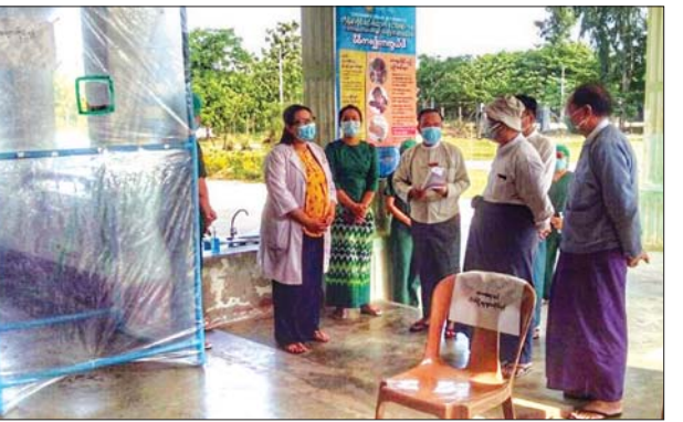
ရသီရိမြို့နယ်ရှိ အခြေခံပညာကျောင်းများတွင် ၄၀၂ ဦး စုစုပေါင်း ၁၅၁၅ ဦးရှိပြီး ဖြစ်ကြောင်း နေပြည်တော် ပြည်သူ့ကျန်းမာရေးဦးစီးဌာနမှ သိရသည်။ အောင်ကို(ပြန်/ဆက်)

ဥက္ကဋ္ဌရသီရိမြို့နယ် အမှတ် (၁၂) အခြေခံပညာအထက်တန်းကျောင်းတွင် ပြည်တွင်းမှ မိမိမြို့နယ်အတွင်းသို့ ပြန်လည်ဝင်ရောက်လာသူများအား အသွားအလာကန့်သတ်ခြင်းထားရှိလျက်ရှိရာ ယနေ့နံနက်ပိုင်းအထိ အမျိုးသား ၁၃ ဦး၊ အမျိုးသမီး ၁၆ ဦး စုစုပေါင်း ၂၉ ဦးရှိပြီး ကိုဗစ်-၁၉ ရောဂါ ထိန်းချုပ်ရေးအတွက် ပြည်ထောင်စုနယ်မြေ နေပြည်တော်အနေဖြင့် နေပြည်တော် ပြင်ပဒေသမှ ဝင်ရောက်လာသူများအား စစ်ဆေးရေးဂိတ် ခြောက်ခုနှင့် ဘူတာ လေးနေရာတို့တွင် ကျန်းမာရေးဝန်ထမ်းများက စစ်ဆေးမှု များ ပြုလုပ်ပြီး လိုအပ်ပါက သတ်မှတ်နေရာအဆောက်အအုံများတွင် ထားရှိစောင့်ကြည့်ရှုလျက်ရှိရာ မေ ၇ ရက် အထိ ဒက္ခိဏာသီရိ မြို့နယ် နယ်ပယ်စောင့်ကြည့်ရေးဌာနတွင် သုံးဦး၊ စည်ပင်စောင့်ကြည့်ရေးဌာနတွင် စာသု ဦး၊ အမှတ်(၃) စစ်ကြောရေးနှင့် တည်းခိုရေးစခန်း (ရွာတော်) တွင် ၂၉၇ ဦးနှင့် မြို့နယ်