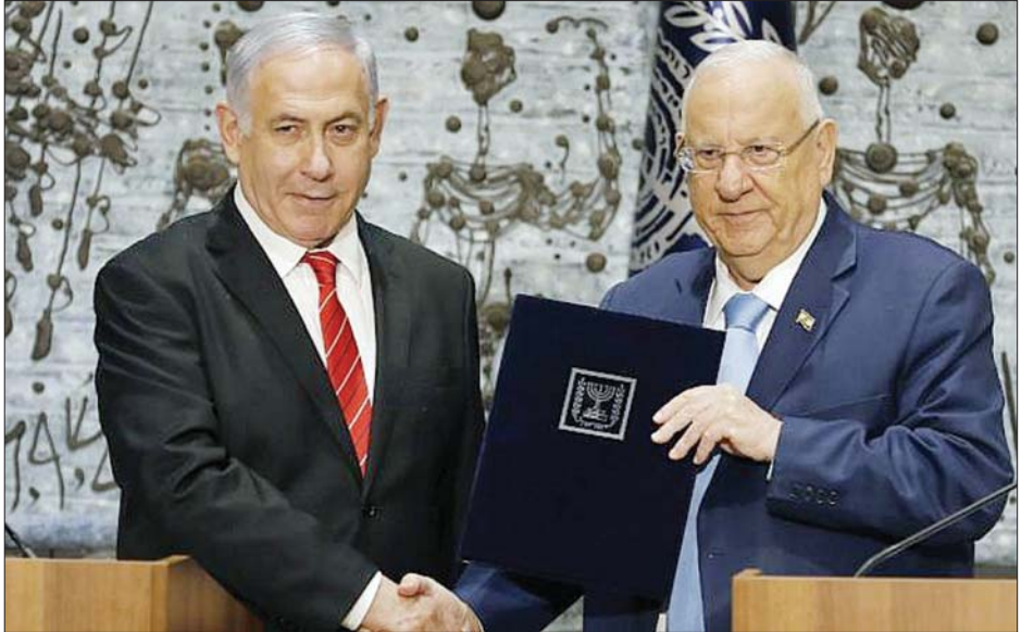
အစွဲအကပ်ကြီးချုပ် ဘင်ဂျမင်နေတန်ယာဟုနှင့် အစွဲအကပ်သမ္မတ ရူဗန်ရက်ဗီလင်း။