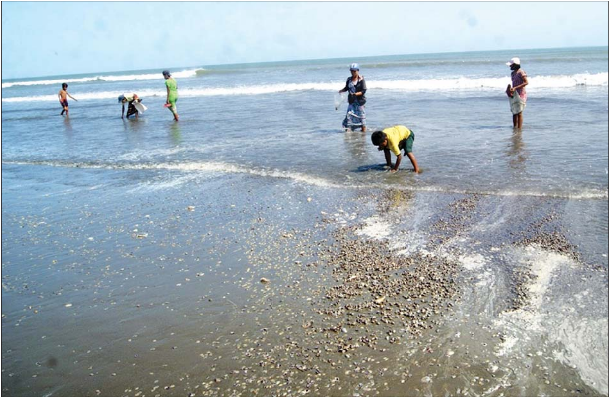
သေဆုံးနေသော ခုံးအကောင်များအကြား ခုံးအကောင်အရွယ်များကို ရှာဖွေတူးယူနေကြသော ဒေသခံများ

ယခုတွေ့ရှိရတဲ့ ခုံးအမျိုးအစားမှာ ဒေသအခေါ် ခုံးချောဖြစ်ပြီး ယင်းအမျိုးအစားများကို ဧရာဝတီတိုင်းဒေသကြီးအတွင်းရှိ ဖျာပုံခရိုင် ဧရာချောင်းဝသောင်ခုံ၌ လည်းကောင်း၊ သောင်သာချောင်းဝ သောင်ခုံ၌ လည်းကောင်း၊ လပွတ္တာခရိုင် အမတ်ကြီးကွင်းပေါက် သောင်ခုံးများ၌ လည်းကောင်း များစွာတွေ့ရှိရကြောင်း၊ ယင်းဒေသများ၌ တွေ့ရှိရသည့် ခုံးများသည် ရောင်းတန်းဝင် အရွယ်အစားများဖြစ်သည့်အပြင် ပြည်တွင်း ဈေးကွက်သာမက ပြည်ပဈေးကွက်များအထိပါ ရောင်းဝယ်ဖောက်ကားမှုများ ရှိကြောင်း၊ လက်ရှိဟိုင်းကြီးကျွန်းဒေသတွင် တွေ့ရှိနေရသော ခုံးများ၏