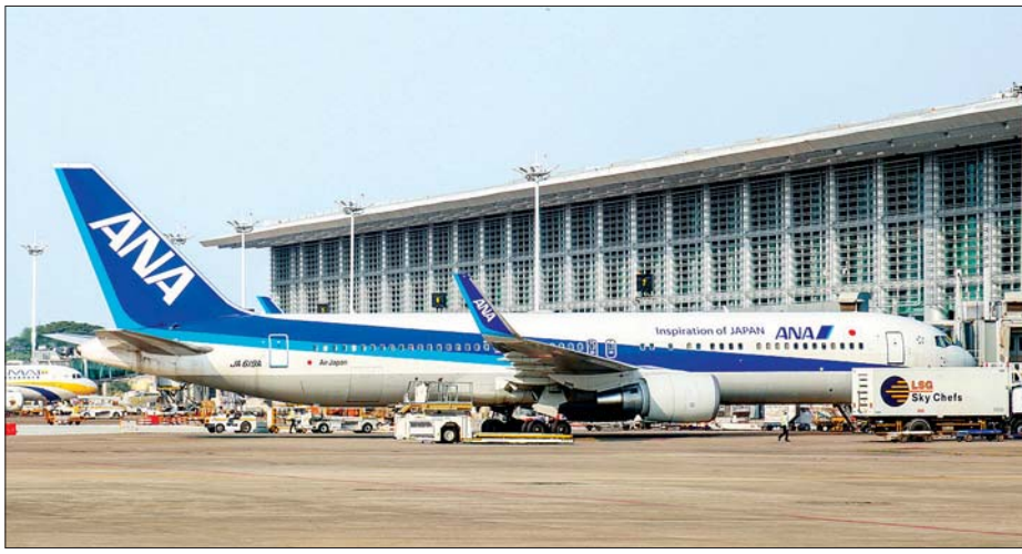
ရန်ကုန်အပြည်ပြည်ဆိုင်ရာလေဆိပ်တွင် ရပ်နားထားသော All Nippon Airways လေကြောင်းလိုင်းမှ လေယာဉ် တစ်စင်း။

ရန်ကုန် မေ ၈ ရန်ကုန်အပြည်ပြည်ဆိုင်ရာလေဆိပ်၌ နိုင်ငံတကာခရီးစဉ်များ ပျံသန်း ပြေးဆွဲမှုကို ရပ်နားထားသော်လည်း ကယ်ဆယ်ရေးနှင့် ကုန်စည်သယ်ယူ ပို့ဆောင်ရေးခရီးစဉ်များမှာ ဆက်လက် ပျံသန်း ပြေးဆွဲလျက်ရှိကြောင်း ရန်ကုန်အပြည်ပြည်ဆိုင်ရာလေဆိပ် ကို စီမံခန့်ခွဲလျက်ရှိသော ရန်ကုန် အေရိုဒရန်းကုမ္ပဏီ၏ ထုတ်ပြန်ချက် များအရ သိရသည်။ နိုင်ငံတကာခရီးစဉ်များ ပျံသန်း ပြေးဆွဲမှုကို ဧပြီ ၂၄ ရက်မှစတင်ကာ ခေတ္တရပ်နားထားခဲ့ပြီး အဆိုပါရပ်နား မှုကို မေ ၁၅ ရက်အထိ ထပ်မံတိုးမြှင့် ထားပြီး ပြည်တွင်းပျံသန်းလျက်ရှိသော လေကြောင်းလိုင်းများမှာမူ ခရီးစဉ် များ ရပ်ဆိုင်းမှုမရှိဘဲ ပျံသန်းမှု အကြိမ်ရေ လျှော့ချပြေးဆွဲလျက်ရှိ ကြောင်း သိရသည်။ မြန်မာနိုင်ငံ၏အဓိကလေကြောင်း ဝင်ထွက်ပေါက်ဖြစ်သော ရန်ကုန် အပြည်ပြည်ဆိုင်ရာ လေဆိပ်၌ နိုင်ငံတကာ လေကြောင်းပျံသန်း ပြေးဆွဲမှု ဆိုင်းငံ့ထားချိန်မှစ၍ ယနေ့