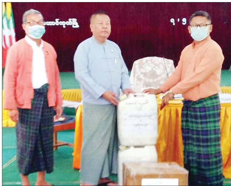
ပြည်နယ်ဝန်ကြီးချုပ် ဦးညီပုနှင့်အဖွဲ့ ဒေါ်ခင်ကြည်ဖောင်ဒေးရှင်းမှ ပေးအပ်လှူဒါန်းမှုကို လက်ခံ ရယူစဉ်။