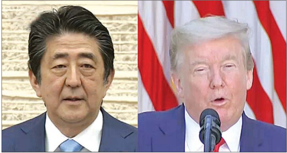
နှစ်နိုင်ငံခေါင်းဆောင်များဖြစ်သည့် ဂျပန်ဝန်ကြီးချုပ် ရှင်ဒိုအာဘေးနှင့် အမေရိကန်သမ္မတ ဒေါ်နယ်ထရမ်