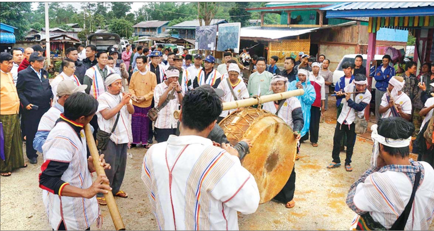
ဒုတိယသမ္မတ ဦးဟင်နရီဗန်ထီးယူ ကယားပြည်နယ် ခရီးသွားလုပ်ငန်းဆောင်ရွက်ထားရှိမှုအခြေအနေများ ကြည့်ရှုစဉ်။

ထို့ပြင် ၂၀၁၈ ခုနှစ်တွင် ဖရူဆိုမြို့နယ်ရှိ ထေခိုကျေးရွာနှင့် ဒီးမော့ဆိုမြို့နယ်ရှိ ဒေါတမ ကြီးကျေးရွာများကို လူထုအခြေပြု ခရီးသွား လုပ်ငန်းများ ဆက်လက်အကောင်အထည် ဖော်လျက်ရှိသည်။ ကယားပြည်နယ်ရှိ လူထု အခြေပြု ခရီးသွားလုပ်ငန်း ဆောင်ရွက်နေ သော ကျေးရွာများကို ဗီဒီယိုမှတ်တမ်း