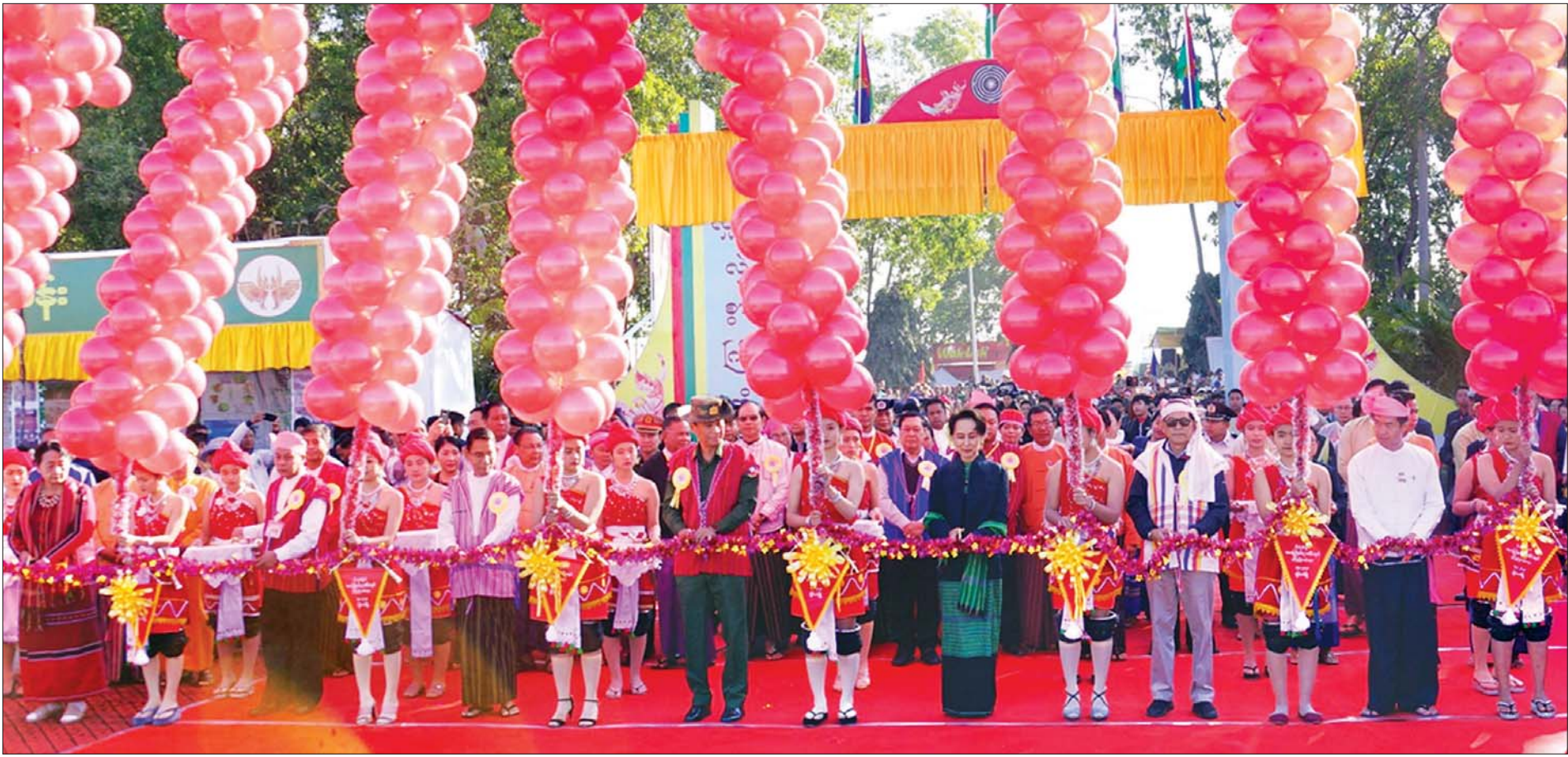
နိုင်ငံတော်၏အတိုင်ပင်ခံပုဂ္ဂိုလ် ဒေါ်အောင်ဆန်းစုကြည် (၆၈) နှစ်မြောက် ကယားပြည်နယ်နေ့အထိမ်းအမှတ် မုခ်ဦးကို ဖဲကြိုးဖြတ် ဖွင့်လှစ်ပေးစဉ်။

ပြည်သူ့က တစ်ခဲနက်ရွေးချယ်တင်မြှောက်ခဲ့သော ပြည်သူ့အစိုးရ၏ သက်တမ်းမှာ လေးနှစ်ပြည့်မြောက်ခဲ့ပြီဖြစ်သည်။ လေးနှစ်တာကာလအတွင်း နိုင်ငံ၏ နိုင်ငံရေး၊ စီးပွားရေး၊ လူမှုရေးနယ်ပယ်အသီးသီးတွင် ဖွံ့ဖြိုးတိုးတက်မှုရရှိစေရန် ပြုပြင်ပြောင်းလဲမှုများပြုလုပ်ကာ နိုင်ငံတည်ဆောက်ရေးလုပ်ငန်းများကို အားကြီးမာန်တက် ဆောင်ရွက်ခဲ့သည့် ပြည်သူ့အစိုးရ၏ ပြည်သူ့အတွက် ကြိုးပမ်းဆောင်ရွက်မှုများမှာ အားလုံးကောင်းမွန်အောင်မြင်ပါသည်ဟူ၍ မဆိုနိုင်သေးသည့်တိုင် သိသာထင်ရှားစွာ မြင်တွေ့နိုင်သည့် အောင်မြင်မှုများ၊ မမြင်တွေ့နိုင်သည့် အောင်မြင်မှုများ၊ စိန်ခေါ်မှုများနှင့် ရုန်းကန်နေရဆဲလုပ်ငန်းစဉ်များဟူ၍ တွေ့ရမည်ဖြစ်သည်။ နိုင်ငံတော်အစိုးရ၏ စတုတ္ထ (၁)နှစ်တာကာလအတွင်း ပြည်သူများအတွက် ကြိုးပမ်းဆောင်ရွက်မှုများကို ဝန်ကြီးဌာနများ၊ ပြည်ထောင်စုအဆင့်အဖွဲ့အစည်းများ၊ တိုင်းဒေသကြီးနှင့် ပြည်နယ်များအလိုက် မှတ်တမ်းပြုတင်ပြအပ်ပါကြောင်း။