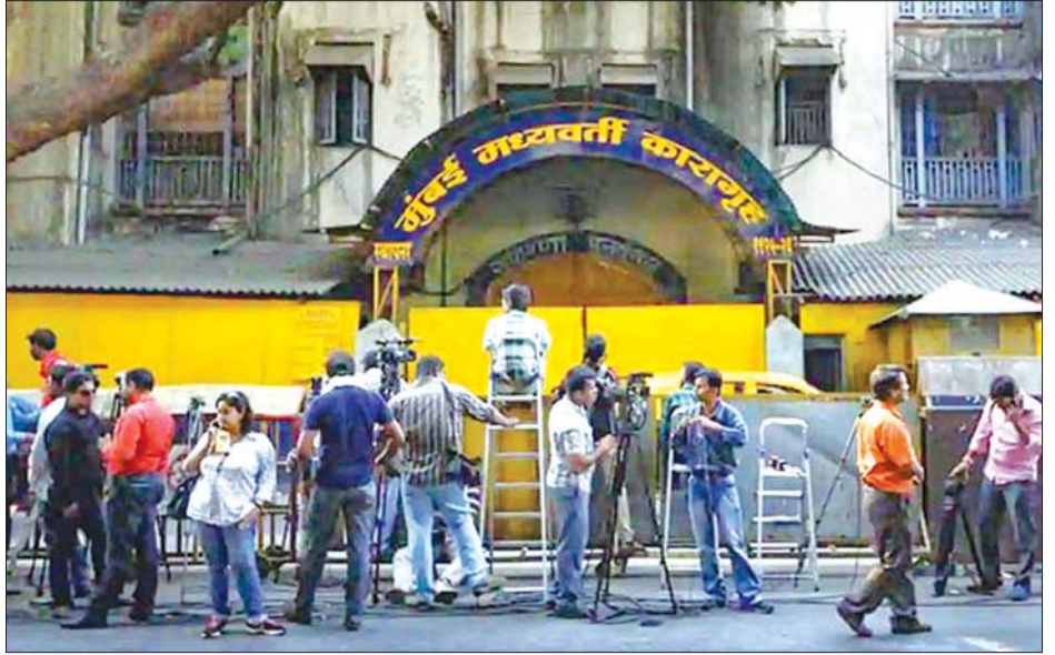
ဗဟိုအကျဉ်းထောင်တွေ့ရှိရသော သတင်းရယူရန် သတင်းသမားများ ရောက်ရှိနေသည်ကို တွေ့ရစဉ်။

ထောင်ခါမျှပြုလုပ်ခဲ့ရာ အကျဉ်းသား ပေါင်း ၂၆၀၀၀ ရှိသည့်အနက် ထောင်ဒဏ်ခန့်ခံရမှုထက် လျော့နည်း ပြီး ပြစ်ဒဏ်ချမှတ်ခံရသည့် အကျဉ်း သား ၅၀၀၀ ကို လွှတ်ပေးခဲ့ကြောင်း ပြည်နယ် ပြည်ထဲရေးဝန်ကြီးက ဆက်လက်ပြောကြားသည်။ အဆိုပါပြည်နယ်တွင် အကျဉ်း ထောင်ပေါင်း ကိုးခုရှိပြီး အကျဉ်းသား ၁၄၀၀၀ ခန့် ထားနိုင်ကြောင်း သိရ သည်။ မွမ်ဘိုင်းတွင် ကိုဗစ်-၁၉ အတည် ပြုလူနာပေါင်း ၁၁၂၀၉ ဦးရှိပြီး လွန်ခဲ့ သော ၂၄ နာရီအတွင်း ကိုဗစ် - ၁၉ ထပ်မံတွေ့ရှိသူ ၆၉၂ ဦးတိုးလာ ကြောင်း သိရသည်။ ကိုဗစ်-၁၉ ကြောင့် သေဆုံးသူ ပေါင်းမှာလည်း ၄၃၇ ဦး အထိ မြင့်တက်လာကြောင်း သိရသည်။ ဆင်ဟွာ