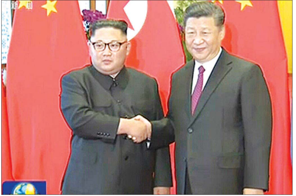
၂၀၁၉ ခုနှစ် ဇွန် ၂၁ ရက်က မြောက်ကိုရီးယားခေါင်းဆောင် ကင်ဂျီအန်းနှင့် တရုတ်သမ္မတ ရှီကျင့်ဖျင်ထံ တွေ့ဆုံစဉ်။

ဆက်လက်ပြောကြားလိုက်သည်။ မြောက်ကိုရီးယားခေါင်းဆောင် ကင်ဂျီအန်းသည် တရုတ်နိုင်ငံက ဆေးဘက်ဆိုင်ရာနှင့်အစားအစာ အကူ အညီများ ကမ်းလှမ်းလာမည်ကို မျှော်လင့်လျက်ရှိကြောင်း လေ့လာသုံးသပ်သူများက ပြောကြားထားသည်။ မြောက်ကိုရီးယားနယ်မြေ ပိုင်နက်အတွင်း မည်သည့် ကိုဗစ်-၁၉ မျှ ကူးစက်မှုများရှိနေသည်ဟု အတည်မပြု နိုင်သေးသော်လည်း ကိုဗစ်-၁၉ ကပ်ရောဂါကြောင့် စီးပွားရေးဆိုင်ရာရိုက်ခတ်မှုကို ခံစားနေရကြောင်း သိရ သည်။ ထို့အတူ တရုတ်နိုင်ငံနှင့် ကုန်သွယ်မှုမှာလည်း ကျဆင်းလာကြောင်း သိရသည်။ ကိုဗစ်-၁၉ ကူးစက်ပျံ့နှံ့ခြင်းကို ကာကွယ်သည့်အနေ ဖြင့် မြောက်ကိုရီးယားနိုင်ငံနှင့် တရုတ်နိုင်ငံအကြား ရထား လမ်းနှင့် လေကြောင်းလိုင်းများ ပျံ့သန်းပြေးဆွဲမှုကို သုံးလ ထက်မက ရပ်နားခဲ့ကြောင်း သိရသည်။ အင်န်အိတ်ချ်ကေ