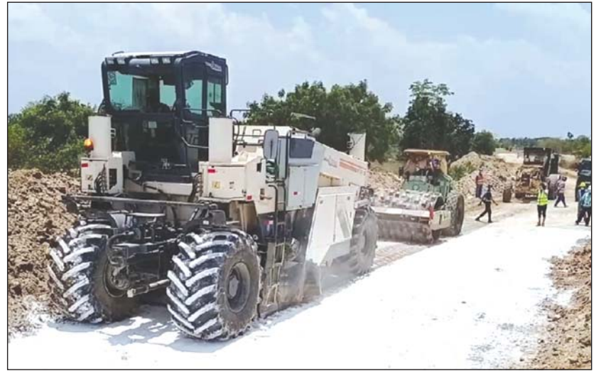
စက်ယန္တရားကြီးများဖြင့် လမ်းလုပ်ငန်း ဆောင်ရွက်နေစဉ်