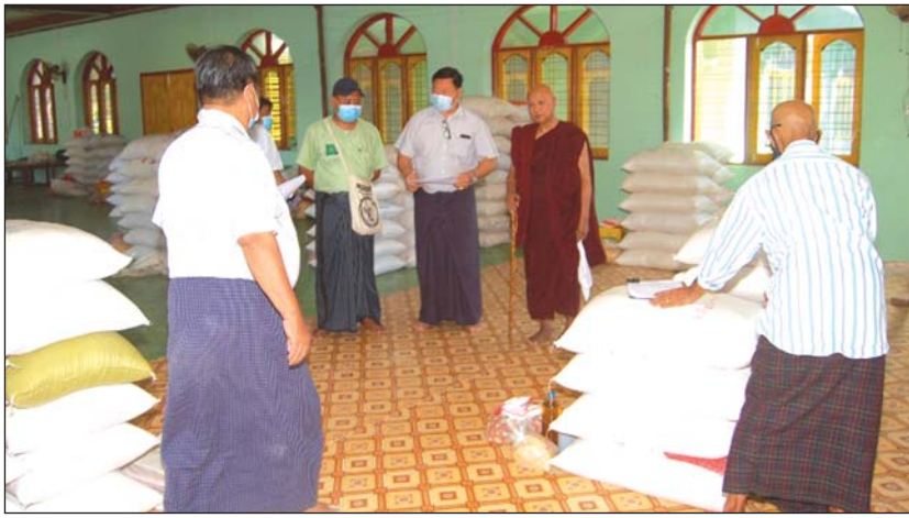
ဘုန်းတော်ကြီးကျောင်းတစ်ကျောင်းသို့ ဆန်အိတ်များ သွားရောက်လှူဒါန်းနေစဉ်

တစ်ပိဿာ၊ သီလရှင်တစ်ပါးလျှင် ဆန်တစ်အိတ်၊ ဆီ ၅၀ ကျပ်သာနှင့် ပဲခြမ်း ၅၀ ကျပ်သာနှုန်းဖြင့် လှူဒါန်းသည်။ ထို့အပြင် မြို့နယ်အတွင်းရှိ သက်တော်ရှည် ဆရာတော်ကြီး ၁၅ ပါးကိုလည်း တစ်ပါးလျှင် ဆန်တစ်အိတ်နှင့် ကျပ်သုံးသောင်းစီ လှူဒါန်းကြောင်း အောင်ဌေး(မလိုင်)