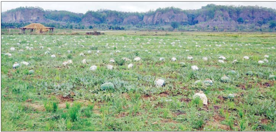
မော်လိုက်မြို့နယ်ရှိ ဖရဲစိုက်ခင်းတစ်ခု။

မော်လိုက် မေ ၈ စစ်ကိုင်းတိုင်းဒေသကြီး မော်လိုက်မြို့နယ်တွင် မိုးစပါး အပြီး ဆောင်းသီးနှံအနေဖြင့် ဖရဲသီး၊ သရက်၊ ပိန္နဲ၊ မာလကာ စသည့်သီးနှံများထဲမှ တောင်သူများက ဖရဲသီးကိုသာ အဓိကအားထားစိုက်ပျိုးခဲ့ကြရာ ယခု နှစ်တွင် ကိုဗစ်-၁၉ ကြောင့် ဈေးကွက်မရှိခြင်း၊ ပြည်ပ သို့ တင်ပို့ရာတွင် သွားလာရေးအဆင်မပြေခြင်း၊ ကုန်စည် သယ်ဆောင်ခ မြင့်တက်ခြင်း၊ ဝယ်လိုအား မရှိခြင်းများ ကြောင့် ဖရဲသီးရောင်းအားများ ကျဆင်းကာ အရှုံးပေါ်နေကြ ရသည်။