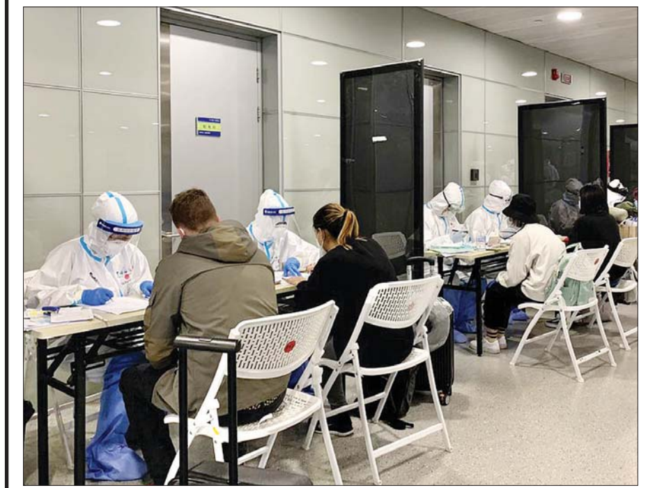
ရှန်ဟိုင်းအပြည်ပြည်ဆိုင်ရာလေဆိပ်တွင် ခရီးသွားများအား သတင်းအချက်အလက်များ ကောက်ယူနေသည့် ဝန်ထမ်းများကို မတ် ၁၅ ရက်က တွေ့ရစဉ်။

ပေကျင်း မေ ၈ တရုတ်နိုင်ငံရှိ ကိုဗစ် -၁၉ အဓိက ဖြစ်ပွားရာ ဟူပေပြည်နယ်တွင် ကိုဗစ် -၁၉ လူနာသစ် ၁၇ ဦးတွေ့ရှိ ခဲ့ပြီး ၎င်းတို့ထဲတွင် ရောဂါလက္ခဏာမပြသသူများလည်း ပါဝင်ကြောင်း တရုတ်ကျန်းမာရေးအရာရှိများက မေ ၈ ရက်တွင် ပြောကြား ခဲ့သည်။ မေ ၇ ရက်ကလည်း တရုတ်နိုင်ငံ ကျင်းလည်ပြည်နယ်တွင် ကိုဗစ် -၁၉ ဒေသတွင်း ကူးစက်ခံရမှုတစ်ခုကို တွေ့ရှိခဲ့သည်ဟု တရုတ်အမျိုးသားကျန်းမာရေး ကော်မရှင်က ပြောသည်။ ဟူပေပြည်နယ်တွင် တွေ့ရှိရသည့်လူနာသစ် ၁၇ ဦးတွင် ၁၆ ဦးမှာ ရောဂါလက္ခဏာမပြပေ။ နောက်ထပ်လူနာသစ် ထည့်ပေါင်းလျှင် တရုတ် နိုင်ငံအတွင်း ရောဂါလက္ခဏာမပြသည့် လူနာအရေအတွက်မှာ ၈၄၅ ဦးရှိပြီး ၎င်းတို့ကို ဆေးပညာပိုင်းဆိုင်ရာ လေ့လာမှုများ ပြုလုပ်နေကြောင်း သိရသည်။ ၎င်းတို့တွင် ကိုဗစ် -၁၉ ဗိုင်းရပ်စ်တွေ့ရှိရသော်လည်း ချောင်းဆိုးခြင်း၊ ဖျားနာခြင်း၊ လည်ချောင်းနာခြင်း အစရှိသည့် လက္ခဏာများ မတွေ့ရှိရပေ။ ဟူပေပြည်နယ်တွင် လူဦးရေ ၅၆ သန်း ရှိပြီး ဇန်နဝါရီ ၂၃ ရက်မှစတင် ကာ ဗိုင်းရပ်စ်ထိန်းချုပ်ရေးအတွက် ပြည်နယ်ကို အသွားအလာပိတ်ဆို့ ကန့်သတ်မှုများ ပြုလုပ်ခဲ့သည်။ ပြည်နယ်မြို့တော်ဖြစ်သည့် ဝူဟန်တွင် ဧပြီ ၈ ရက်မှစတင်ကာ အသွားအလာပိတ်ဆို့ ကန့်သတ်မှုများ ဖယ်ရှားပေးခဲ့ပြီး မြို့တော်တွင် နေထိုင်ကြသည့် လူ ၁ သန်းမှာ ပုံမှန်နေထိုင်မှုမျိုး ပြန်ရောက်ရန် ဖြည်းဖြည်းချင်း လျှောက်လှမ်းနေကြသည်။ ဟူပေပြည်နယ်တွင် ရက်ပေါင်း ၃၄ ရက်အတွင်း ကိုဗစ် -၁၉လူနာသစ် မတွေ့ရှိရဟု ဆင်ဟွာသတင်းဌာနတွင် ဖော်ပြခဲ့သည်။ ဟူပေပြည်နယ်တွင် ကိုဗစ် -၁၉ ကူးစက်ခံရသူပေါင်း ၆၈၅၁ ဦးရှိပြီး ၎င်းတို့ထဲမှ ၅၀၃၃ မှာ ဝူဟန်မြို့မှဖြစ်သည်။ ပီတီအိုင်