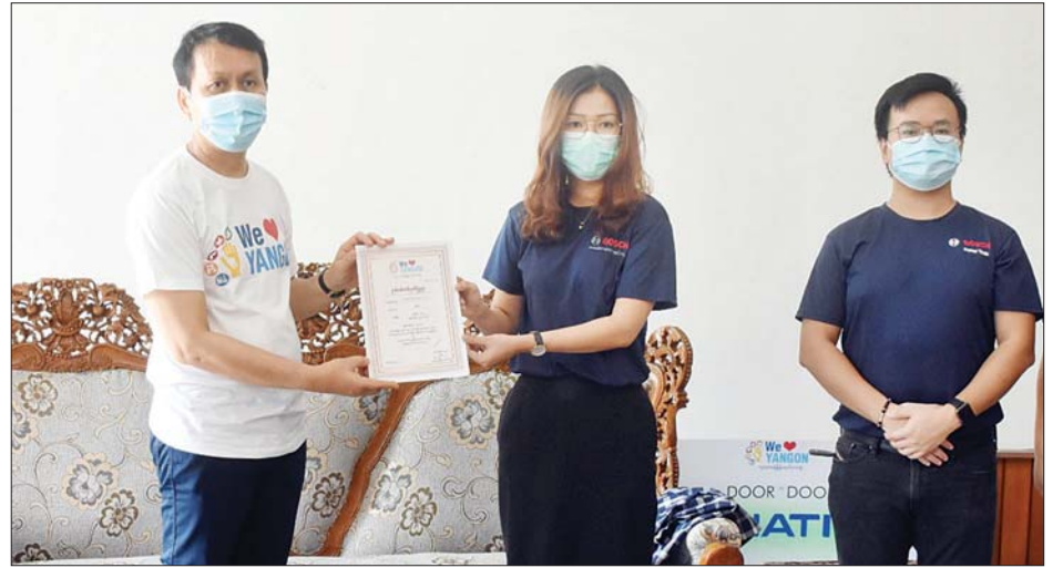
တိုင်းဒေသကြီး ဝန်ကြီးချုပ် ဦးမြမင်းသိန်း လှူဒါန်းမှုအတွက် ဂုဏ်ပြုမှတ်တမ်းလွှာပြန်လည်ပေးအပ်စဉ်။