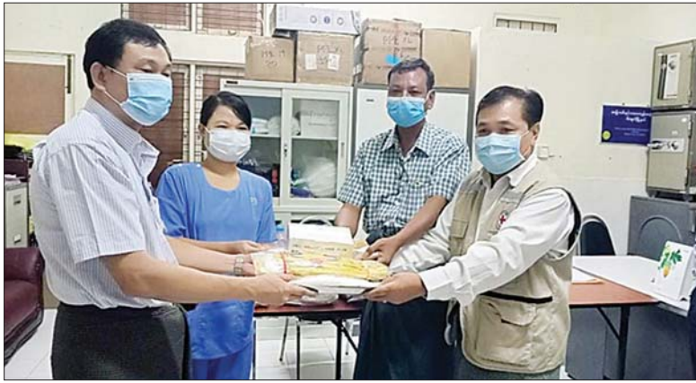
ကျောက်တံခါး မေ ၈ - ပဲခူးတိုင်းဒေသကြီး ကျောက်တံခါးမြို့နယ် လက်ပံခင်ကျေးရွာ၌ မေ ၈ ရက်က ရေကြီးမှုအန္တရာယ်မှ ကင်းဝေးရန်အတွက် တိမ်ကောနေသောမူလချောင်းရိုးကို ကျေးရွာနေပြည်သူများ စုပေါင်းကာ ကိုယ့်အားကိုးကိုး တူးဖော်ခဲ့ကြောင်း သိရသည်။

မော်လမြိုင်ကျွန်းမြို့နယ်တွင် ကိုဗစ်-၁၉ ထိန်းချုပ်ရေးနှင့် ကုသရေးလုပ်ငန်းများဆောင်ရွက်ရာတွင် အသုံးပြုနိုင်ရေးအတွက် We Love AyayarWaddy အဖွဲ့က မော်လမြိုင်ကျွန်းမြို့ ခုတင် ၁၀၀ ဆေးရုံသို့ ရောဂါကာကွယ်ရေးဝတ်စုံ ၁၀ စုံ၊ နှာခေါင်းစည်း ၄၀၀၊ လီတာ လက်သန့်ဆေးရည် ၁၈ ဘူး၊ ၅၀၀ လီတာ လက်သန့်ဆေးရည် သုံးဘူး၊ လက်ဆိတ်အရည် အစုံ ၃၀၊ မျက်နှာ အုပ် ၃၀ တို့ကို မေ ၇ ရက်က မြို့နယ် ခုတင် ၁၀၀ ဆေးရုံအုပ်ကြီး ဒေါက်တာ စန်းဝင်းထံသို့ လာရောက်လှူဒါန်းခဲ့သည်။ အောင်အောင် (ပြန်/ဆက်)