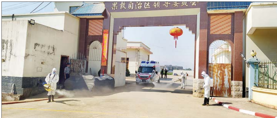
ဖြင့် ပတ်ဖျန်းပေးခြင်းများ ဆောင်ရွက် နယ်မြေခံ နယ်ခြားစောင့်တပ်တို့မှ ကြည့်ရှုခဲ့ကြကြောင်း သိရသည်။ ခေတ်ဇော်အောင် (ပြန်/ဆက်)

ကိုးကန့်ကိုယ်ပိုင်အုပ်ချုပ်ခွင့်ရဒေသ လောက်ကိုင်မြို့တွင် ကိုဗစ်- ၁၉ ကာကွယ် ထိန်းချုပ်နိုင်ရေးအတွက် လောက်ကိုင်မြို့ပေါ် ရပ်ကွက်များ တွင် ယနေ့နံနက်ပိုင်းက ပိုးသတ်ဆေး ဖျန်းခြင်းများ ဆောင်ရွက်ခဲ့သည်။ ထိုသို့ ပိုးသတ်ဆေးဖျန်းခြင်းများ ဆောင်ရွက်ရာတွင် လောက်ကိုင် ဒေသကွပ်ကဲမှု စစ်ဌာနချုပ်နှင့် နယ်မြေခံ နယ်ခြားစောင့်တပ်တို့ ပူးပေါင်း၍ ရပ်ကွက်များအတွင်း ပတ်ဖျန်းပေးခြင်းနှင့် မြို့ပေါ်လမ်းများ၊ လမ်းသွယ်များ၌ မော်တော်ယာဉ်များ