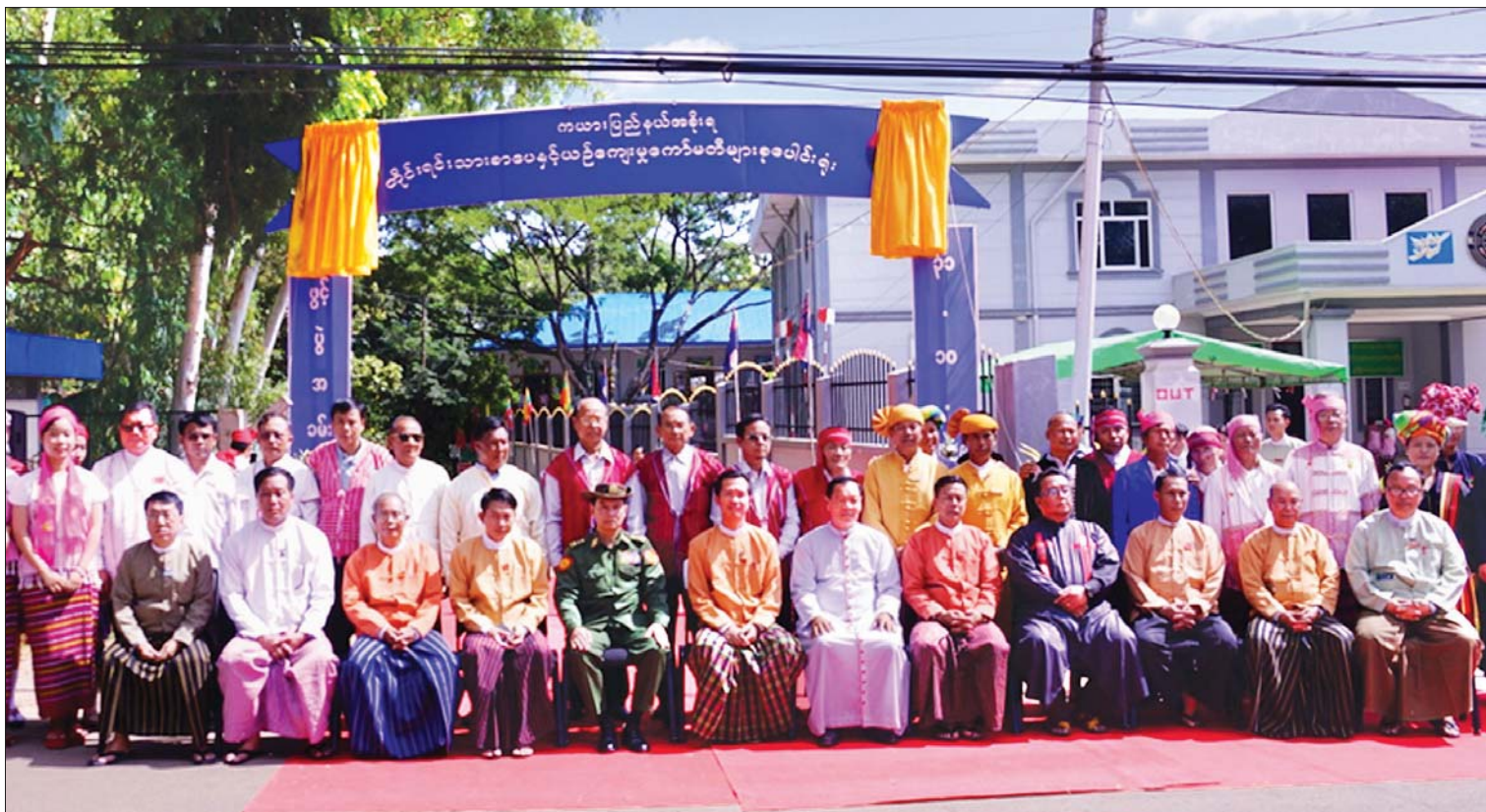
ကယားပြည်နယ်ဝန်ကြီးချုပ် ဦးအယ်လ်ဖောင်းရှီနှင့် တာဝန်ရှိသူများ တိုင်းရင်းသားစာပေနှင့် ယဉ်ကျေးမှုကော်မတီများစုပေါင်းရုံး အဆောက်အဦသစ် ဖွင့်ပွဲအခမ်းအနားတွင် စုပေါင်းမှတ်တမ်းတင် ဓာတ်ပုံရိုက်ကူးစဉ်။

ကာယပြည်နယ်အနေဖြင့် ဒီဇင်ဘာလထု အားကစားလ လုပ်ရှားမှုများတွင် အတက်ကြွ ဆုံးပါဝင်ဆင်နွှဲခဲ့ကြသဖြင့် ၂၀၁၇ ခုနှစ်တွင် တိုင်းဒေသကြီးနှင့် ပြည်နယ်အဆင့် တတိယ ဆု၊ ၂၀၁၈ ခုနှစ်နှင့် ၂၀၁၉ ခုနှစ်တို့တွင် ပထမ ဆုများကို ထိုက်တန်စွာရရှိခဲ့သည်။ နိုင်ငံ တကာ အဖွဲ့အစည်းများနှင့် ပူးပေါင်းဆောင်