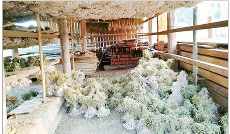
မယ်စွဲဒေသထွက် ကြက်သွန်ဖြူများကို တွေ့ရစဉ်။

မယ်စွဲကုန်သွယ်ရေးစခန်းမှ စီးပွားရေးဖွံ့ဖြိုး တိုးတက် စေရေးအတွက် သွင်းကုန်အစားထိုးခြင်းနှင့် ပို့ကုန်မြှင့်တင် ခြင်းတို့ကို ဆောင်ရွက်လျက်ရှိရာ ဒေသထွက်ကြက်သွန်ဖြူ များကို အရည်အသွေးကောင်းပြီး ဈေးကွက်ဝင်သော ထုတ်ကုန်များ ထုတ်လုပ်နိုင်ပါက ဒေသခံတောင်သူများ အတွက် ဈေးနှုန်းဝယ်ယူခြင်း၊ ဈေးကောင်းချိန် မျှော်လင့် စောင့်ဆိုင်းခြင်းမျိုး မဖြစ်စေဘဲ တောင်သူနှင့် ကုန်သည် နှစ်ဦးနှစ်ဖက် အထောက်အကူပြုနိုင်မည်ဖြစ်ကြောင်း သိရသည်။