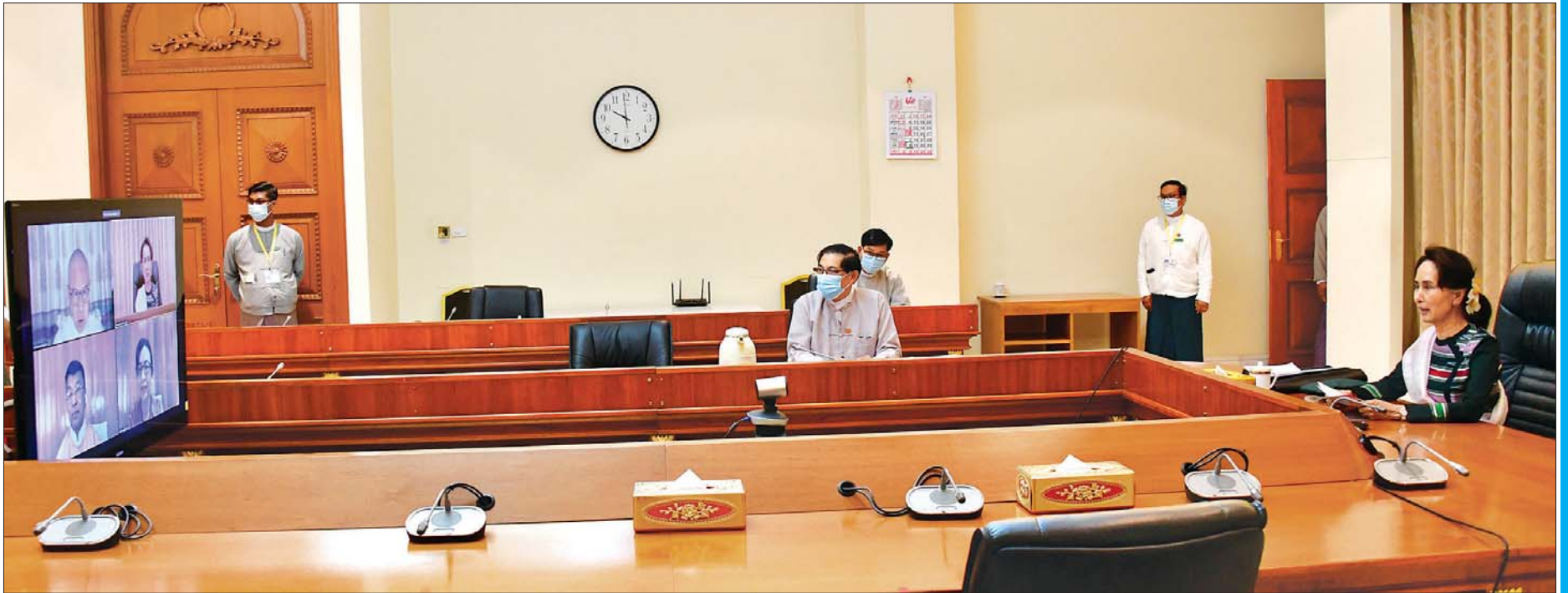
နိုင်ငံတော်၏အတိုင်ပင်ခံပုဂ္ဂိုလ် ဒေါ်အောင်ဆန်းစုကြည် COVID-19 ကာကွယ်၊ ထိန်းချုပ်၊ ကုသရေးလုပ်ငန်းများတွင် ပါဝင်ဆောင်ရွက်နေသည့် စစ်ကိုင်းတိုင်းဒေသကြီးမှ ပြည်သူများနှင့် Video Conferencing စနစ်ဖြင့် ချိတ်ဆက် တွေ့ဆုံ၍ လက်တွေ့အခြေအနေများအား အပြန်အလှန်ဆွေးနွေးစဉ်။