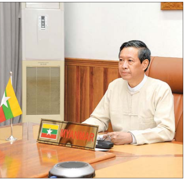
ပြည်ထောင်စုဝန်ကြီး ဒေါက်တာမျိုးသိမ်းကြီး ကိုဗစ်-၁၉ ကာလ ပညာရေးဆိုင်ရာ Global Partnership for Education (GPE) ဝန်ကြီးများအဆင့် အစည်းအဝေးတက်ရောက်စဉ်။