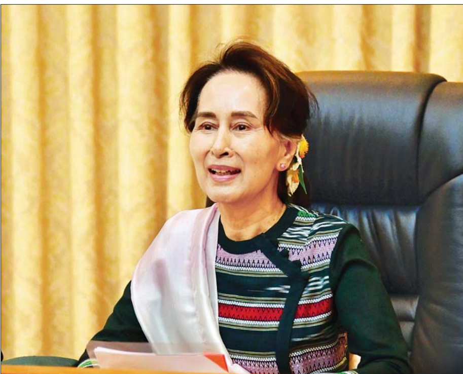
နိုင်ငံတော်၏အတိုင်ပင်ခံပုဂ္ဂိုလ် ဒေါ်အောင်ဆန်းစုကြည် COVID-19 ကာကွယ်၊ ထိန်းချုပ်၊ ကုသရေးလုပ်ငန်း များတွင် ပါဝင်ဆောင်ရွက်နေသည့် စစ်ကိုင်းတိုင်းဒေသကြီးမှ ပြည်သူများနှင့် Video Conferencing စနစ်ဖြင့် ချိတ်ဆက်တွေ့ဆုံ၍ လက်တွေ့အခြေအနေများအား အပြန်အလှန်ဆွေးနွေးစဉ်။ သတင်းစဉ်

က COVID-19 ရောဂါ ကာကွယ်ရေးနှင့် ကုသရေးလုပ်ငန်း များ ဆောင်ရွက်နေမှု၊ Coronavirus ပိုးတွေ့လူနာများ လက်ခံကုသပေးရန် နေရာပြင်ဆင်ထားရှိမှုနှင့် ကုသရေးအဖွဲ့ငယ်များ ဖွဲ့စည်းထားရှိမှု၊ COVID-19 ရောဂါကာကွယ်၊ ထိန်းချုပ်ရေးသင်တန်းများပေးနေမှု၊ စာမျက်နှာ ၃ ကော်လံ ၁ *