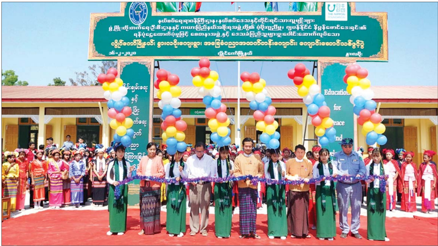
ကယားပြည်နယ် ဝန်ကြီးချုပ် ဦးအယ်လ်ဖောင်းရှီနှင့် တာဝန်ရှိသူများ လျှင်ကော်မြို့၊ နွားလင်းကျေးရွာရှိ အခြေခံပညာအထက်တန်းကျောင်း ကျောင်းဆောင်သစ်ကို ဖြန့်ဖြူးဖြတ်ဖွင့်လှစ်ပေးစဉ်။

လေးနှစ်တာ ကာလအတွင်း ပြည်ထောင်စု ငွေလုံးငွေရင်း ရန်ပုံငွေဖြင့် ကယားပြည်နယ် အတွင်း ကျောင်းဆောင်သစ် ၂၂၂ လုံး ဆောက်လုပ်နိုင်ခဲ့ပြီး စုစုပေါင်း ငွေကျပ်သန်း ၁၀၅၉၃ ဒသမ ၀၈၉ ကုန်ကျခဲ့သည်။ ၂၀၁၉ ခုနှစ် ဒီဇင်ဘာလ ၁ ရက်တွင် လျှင်ကော် ပညာရေးကောလိပ် အဖြစ် သီးသန့် ဖွင့်လှစ်နိုင်ခဲ့ပြီး ကျောင်းသား ၃၂၀ ကို လက်ခံ သင်ကြားပေးလျက်ရှိ