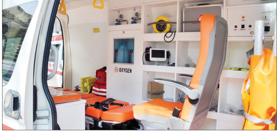
ဖောင်ကြီးသို့ကိုဗစ်-၁၉ လူနာပို့ဆောင်မည့်ယာဉ်အတွင်းပိုင်း ပြင်ဆင်ထားမှုကို တွေ့ရစဉ်။

ရန်ကုန်တိုင်းဒေသကြီးအတွင်းရှိ ဆေးရုံများနှင့် ကိုဗစ်-၁၉ စောင့်ကြည့်နေရာများတွင် ရောဂါလက္ခဏာဖြစ်ပေါ်လာပါက အဆိုပါလူနာများအား ကိုဗစ်-၁၉ ကျန်းမာရေးစင်တာ (ဖောင်ကြီး)သို့ လျင်မြန်စွာပို့ဆောင်နိုင်ရန် ရန်ကုန်ပြည်သူ့ဆေးရုံကြီး၌ ရန်ကုန်တိုင်းလူမှုကယ်ဆယ်ရေးအဖွဲ့မှ ယာဉ်မောင်းများ ၂၄ နာရီ အသင့်ထားရှိကြောင်း ရန်ကုန်ဆေးရုံကြီး အရေးပေါ်ကုသဌာနမှ သိရသည်။