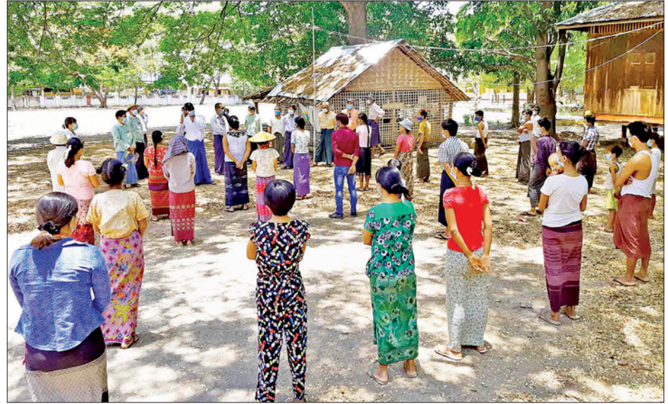
လွှတ်တော်ကိုယ်စားလှယ်များနှင့်အဖွဲ့ နေရပ်ပြန်ပြည်သူများနှင့် တွေ့ဆုံဆွေးနွေးစဉ်။