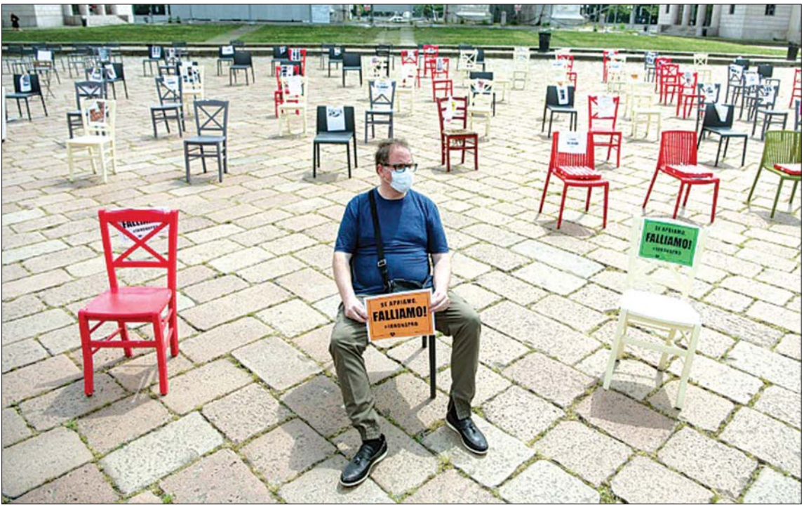
စီးပွားရေးလုပ်ငန်းများ ကာလရှည်ကြာစွာပိတ်ထားသည့်အတွက် မိလန်တွင် စားသောက်ဆိုင်ပိုင်ရှင်တစ်ဦး၏ ဆန္ဒဖော်ထုတ်နေမှု။

ကန့်သတ်မှုတွေ လျှော့ချပေးနေတာကို ဥရောပရဲ့ အကြီးဆုံးစီးပွားရေးနိုင်ငံကြီးလို့ဆိုရ