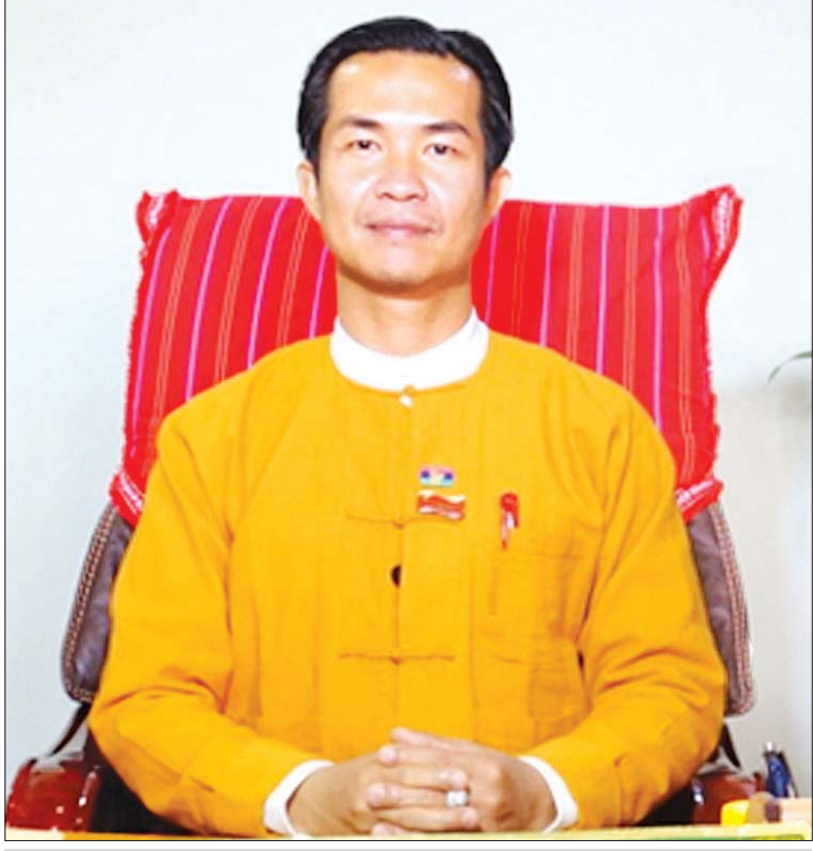
ကယားပြည်နယ်ဝန်ကြီးချုပ် ဦးအယ်လ်ဖောင်းရှိ

ဖွံ့ဖြိုးတိုးတက်လာခဲ့သည်။ ထို့အပြင် ပြည်နယ်အစိုးရအဖွဲ့အနေဖြင့် ရှမ်းပြည်နယ် ညောင်ရွှေ-အင်းလေးဒေသ နှင့် ကယားပြည်နယ် လွိုင်ကော်မြို့ တို့ကို ဆက်သွယ်ဆောင်ရွက်နိုင်ရန်အတွက် ညောင်ရွှေ-တုံဟုံး-စံကား-လွိုင်ကော်လမ်း ပိုင်းကို ပြင်ဆင်ဆောင်ရွက်နိုင်ရေး နိုင်ငံတော် အကြီးအကဲများထံ တင်ပြဆောင်ရွက်ပေးခဲ့ သည်။ အဆိုပါလမ်းပိုင်း ကောင်းမွန်ပါက ရှမ်းပြည်နယ် ညောင်ရွှေ-အင်းလေးဒေသမှ ကယားပြည်နယ်သို့ လာရောက်မည့် ခရီးသွား ဧည့်သည်များ ပိုမိုအဆင်ပြေလွယ်ကူသွားမည် ဖြစ်သည်။ နယ်စပ်ကုန်သွယ်ရေး မြန်မာ-ထိုင်းနယ်စပ်ရှိ မယ်စုံမြို့ နယ်စပ် ကုန်သွယ်ရေးစခန်းကို ၂၀၁၄ ခုနှစ်တွင် စတင် ဖွင့်လှစ်ခဲ့ပြီး ၂၀၁၆ ခုနှစ် အောက်တိုဘာ ၂၇ ရက်တွင် နယ်စပ်ကုန်သွယ်ရေးလမ်း ကြောင်း ဖောက်လုပ်နိုင်ခဲ့သဖြင့် ကူးသန်း ရောင်းဝယ်မှုများ တိုးတက်လာပြီး ၂၀၁၉- ၂၀၂၀ ဘဏ္ဍာနှစ်အတွင်း ကုန်သွယ်မှုပမာဏ မှာ အမေရိကန်ဒေါ်လာ ၂ ဒသမ ၀၇၁ သန်း အထိ ဆောင်ရွက်နိုင်ခဲ့သည်။ ထိုင်းနိုင်ငံဘက်သို့ လယ်ယာထွက်သီးနှံ များဖြစ်သော ကြက်သွန်ဖြူ၊ ကြက်သွန်နီ၊