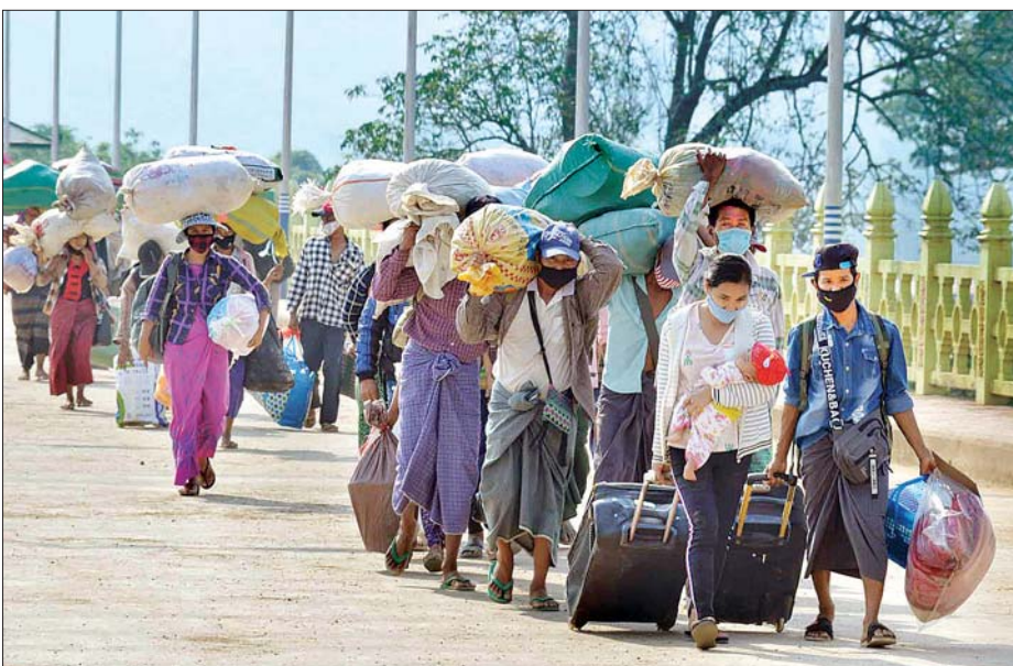
ပြုလုပ်ပြီးသော နေရပ်ပြန် မြန်မာအလုပ်သမား ၅၅၃ ဦးကို မေ ၄ ရက်က တစ်ကြိမ်၊ မေ ၈ ရက်က တစ်ကြိမ် စုစုပေါင်း ၁၂၀၈ ဦးကို နယ်စပ်ဒေသ မိုင်းယုမြို့မှတစ်ဆင့် ပို့ဆောင်ပြီးသော သင်္ချာဆိုင်ရာတာဝန်ရှိသူများက ပို့ဆောင် ပေးနိုင်ခဲ့ကြောင်း သိရသည်။ ကိုကိုနိုင်(မိုင်းယု)