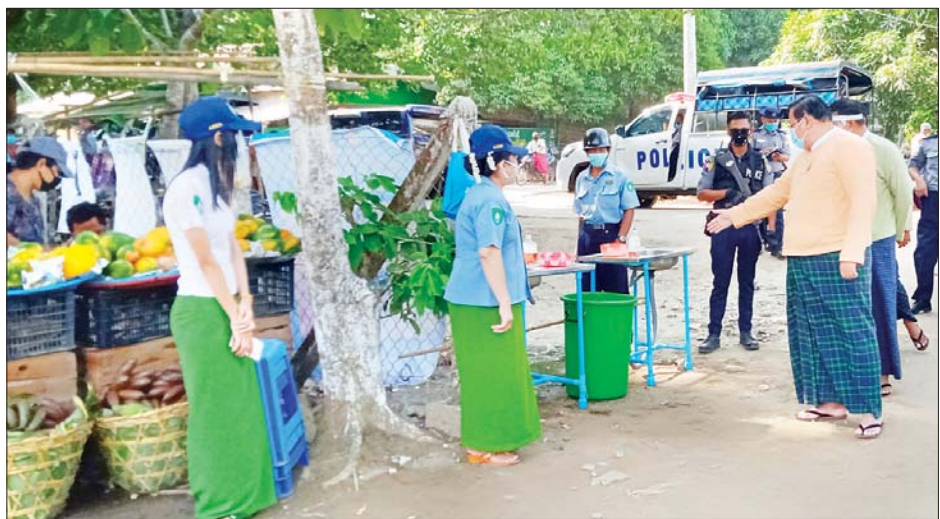
တိုင်းဒေသကြီး ဝန်ကြီးချုပ် ဦးလှမိုးအောင် ယာယီဈေးအဝင်၌ လက်ဆေးခြင်းအစီအစဉ်ဆောင်ရွက်ထားမှုအား ကြည့်ရှုစစ်ဆေးစဉ်။