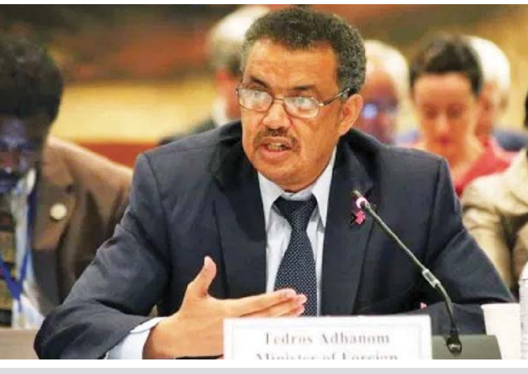
ကမ္ဘာ့ကျန်းမာရေးအဖွဲ့ညွှန်ကြားရေးမှူး တက်ရိုက်အက်ဟာနွန်