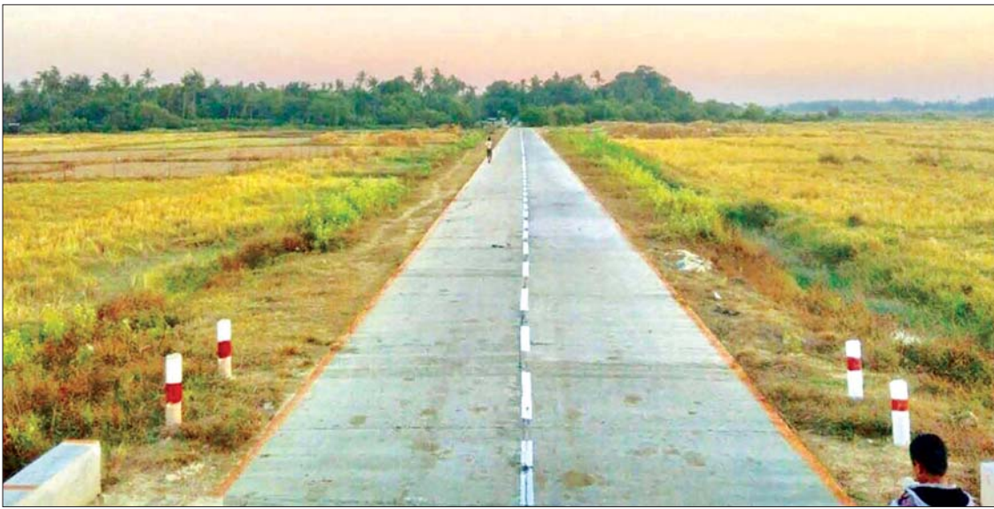
၂၀၁၈-၂၀၁၉ ဘဏ္ဍာရေးနှစ်တွင် ရသေ့တောင်မြို့နယ် ဘူးသီးတောင်-အငူမော်လမ်း မြေသားလမ်းချဲ့ခြင်းနှင့် ကွန်ကရစ်ခင်းခြင်းလုပ်ငန်း ဆောင်ရွက်ပြီးစီးမှုကို တွေ့ရစဉ်။

ရခိုင်ပြည်နယ်အတွင်း လယ်ယာကဏ္ဍ ဖွံ့ဖြိုးတိုးတက်ရေး၊ စိုက်ပျိုးရေးရရှိရေး၊ ရေကြီးနစ်မြုပ်မှုကာကွယ်ရေး၊ ပင်လယ်ရေငန်ဝင်ရောက်မှုမှ ကာကွယ်ရေး၊ သောက်သုံးရေရရှိရေးလုပ်ငန်းများအတွက် ရေငန်တားတာ