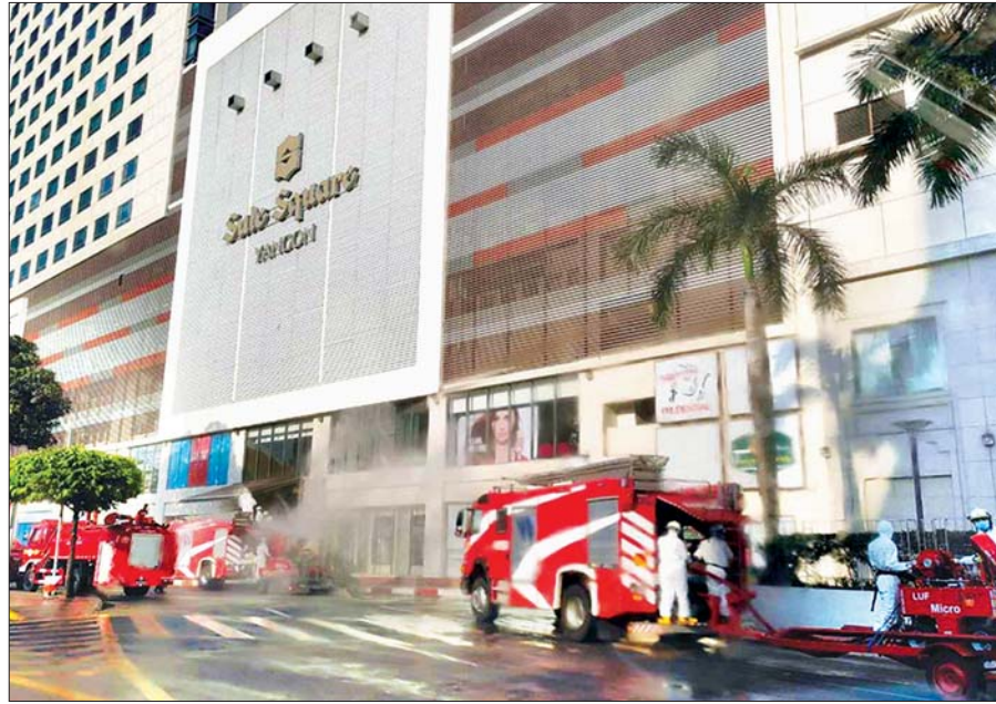
၃၀.၄.၂၀၂၀ ရက်က ရန်ကုန်တိုင်းဒေသကြီး Sule Square တွင် COVID-19 ကာကွယ်ဆေးဖျန်းစဉ်။