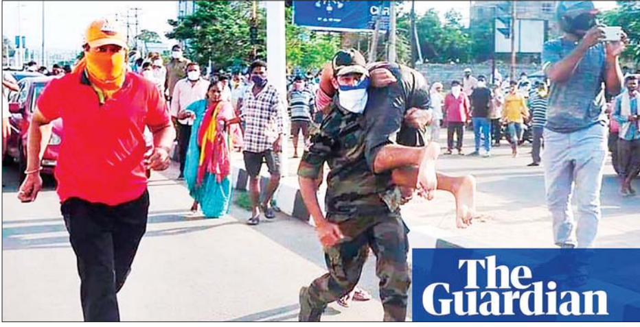
ကယ်ဆယ်ရေးအဖွဲ့ဝင်များက ဓာတ်ငွေ့ယိုစိမ့်မှုကြောင့် ထိခိုက်ခဲ့သူများကို ကယ်ဆယ်ရေးဆောင်ရွက်နေစဉ်။

နယူးဒေလီ မေ ၇ အိန္ဒိယနိုင်ငံ အရှေ့ဘက်ကမ်းခြေရှိ ဓာတ်ငွေ့ယိုစိမ့်မှုကြောင့် လူ ငါးဦး ထက်မနည်းသေဆုံးခဲ့ပြီး လူ ၁၀၀၀ ကျော်ကို ဆေးရုံသို့ပို့ဆောင်ခဲ့ရ ကြောင်း အာဏာပိုင်များက မေ ၇ ရက်တွင် ပြောကြားခဲ့သည်။