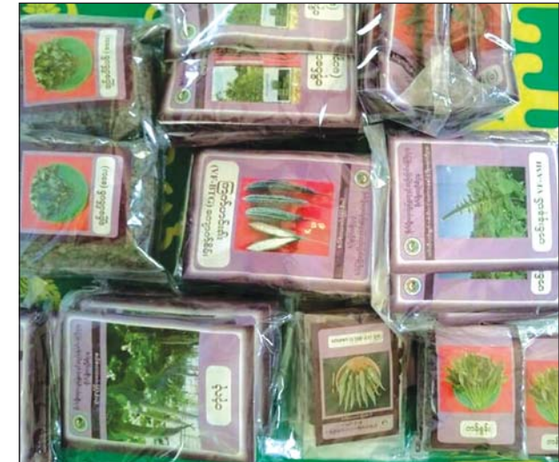
အိမ်တွင်းစိုက်ပျိုးနည်းနှင့် မျိုးစေ့များ ကူညီဆောင်ရွက်ပေးသွားမည်ဖြစ်ကြောင်း မြို့နယ်စိုက်ပျိုးရေးဦးစီးဌာနမှ သိရသည်။

သာယာဝတီမြို့နယ် စိုက်ပျိုးရေးဦးစီးဌာနမှ မျိုးစေ့ ၁၀ မျိုးဖြစ်သည့် ရွှေဖရုံ၊ ရုံးပတ်သီး၊ သခွား၊ ဘူး (ရှည်၊ ပိုင်း၊ လုံးကြီး)၊ တိုင်ထောင်ပဲ၊ ပြောင်းချို၊ ကြက်ဟင်းခါး၊ ခရမ်းသီး၊ ခရမ်းညို၊ ဟင်းနုနှင့် စသည့်မျိုးစေ့တို့ကို အိမ်ခြံ ဝန်းတို့တွင် စိုက်ပျိုးမည့်သူများကို စိုက်ပျိုးရေး အိမ်ရာစိုက်ခင်း နည်းပညာများ