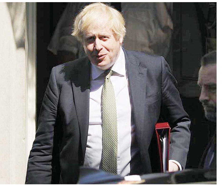
ဗြိတိန်ဝန်ကြီးချုပ် ဘောရစ်ဂျွန်ဆင်

ကြားလိုက်သည်။ ကိုဗစ်-၁၉ ကူးစက်ပျံ့နှံ့မှုကို ကိုင်တွယ်ဖြေရှင်းနိုင်ရေး အစိုးရ၏ နည်းဗျူဟာများအပေါ် မေးမြန်းချက်နှင့်ပတ်သက်ပြီး စတာမာက ဗြိတိန်ဝန်ကြီးချုပ်သည် ရက်သတ္တတစ်ပတ်ထက်စောပြီး လုပ်ငန်းခွင်ပြန်လည် ဝင်ရောက်လာမည်ဆိုပါက အစိုးရ၏ ချဉ်းကပ်မှုပုံစံသည် အောင်မြင်မည်ဟု ပြည်သူများက ထင်မြင်ယူဆကြောင်း၊ သို့သော်လည်း ယမန်နေ့က ကြားသိရသလောက် ကိုဗစ်-၁၉ကြောင့် အင်္ဂလန်တွင် လူပေါင်း ၂၉၄၂၇ ဦးအထိ သေဆုံးခဲ့ကြောင်း၊ မည်သည့်အတွက်ကြောင့် ထိုသို့ဖြစ်ရကြောင်း မေးမြန်းခဲ့သည်။ စတာမာ၏ မေးမြန်းချက်အပေါ် ဂျွန်ဆင်က ကိုဗစ် - ၁၉ နှင့်ပတ်သက်ပြီး အခြားနိုင်ငံများ၏ စာရင်းဇယားများနှင့် နှိုင်းယှဉ်ရန် စောလွန်းသေးကြောင်း ပြောကြားလိုက်သည်။