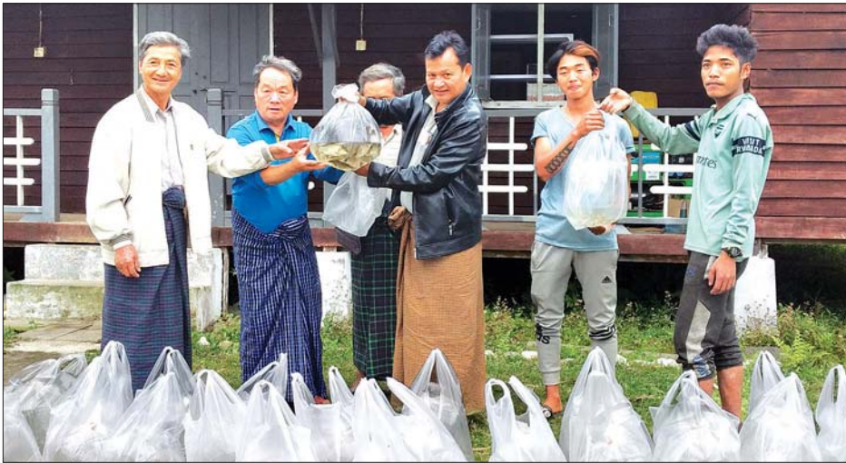
ပူတာအိုငါးလုပ်ငန်းစခန်းက ငါးသားပေါက်များ ဖြန့်ဝေပေးစဉ်။

ပူတာအို မေ ၇ ကချင်ပြည်နယ် ငါးလုပ်ငန်းဦးစီးဌာန က ငါးသယ်ဇာတထိန်းသိမ်းခြင်း လုပ်ငန်းများကို ဒေသခံပြည်သူ များ သိရှိနားလည်ပြီး လိုက်နာ ဆောင်ရွက်ကြစေရေးအတွက် အသိ ပညာပေးပို့စာတမ်းများကို ငါးမဖမ်းရ ရာသီသုံးလတာကာလအတွင်း နေရာ အနှံ့ စိုက်ထူလျက်ရှိသည်။