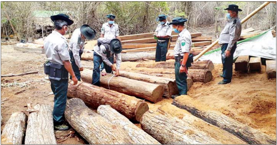
တန်၊ အခြား ၂၈၂ ဒသမ ၂၈၇၀ တန်၊ ပြစ်မှုကျူးလွန်သူ ၄၅ ဦး၊ ယာဉ်/ ကြောင်း သစ်တောဦးစီးဌာနမှ သိရ စုစုပေါင်း ၅၁၈ ဒသမ ၉၄၈၄ တန်၊ ယန္တရား အစီး ၃၀ ဖမ်းဆီးရမိခဲ့ သည်။ ညီညီသန်း(နေပြည်တော်)

နေပြည်တော် မေ ၇ သယံဇာတနှင့် သဘာဝပတ်ဝန်းကျင် ထိန်းသိမ်းရေးဝန်ကြီးဌာန သစ်တော ဦးစီးဌာနသည် တရားမဝင် သစ်နှင့် သစ်တောထွက်ပစ္စည်းများ ရှာဖွေ ဖော်ထုတ်ဖမ်းဆီးရေးအား ပြည်သူ့ ပူးပေါင်းပါဝင်မှုဖြင့် လူထုအခြေပြု စောင့်ကြပ်ကြည့်ရှု သတင်းပို့စနစ် အပါအဝင် နည်းလမ်းမျိုးစုံဖြင့် အကောင်အထည်ဖော် ဆောင်ရွက် လျက်ရှိရာ ဧပြီ ၂၇ ရက်မှ မေ ၃ ရက် အထိ နေပြည်တော်ကောင်စီနယ်မြေ/ တိုင်းဒေသကြီး/ ပြည်နယ်၊ သစ်တော ဦးစီးဌာနများမှ ပေးပို့လာသော စာရင်း များအရ တရားမဝင်ကျွန်း ၁၈၄ ဒသမ ၃၂၀၂တန်၊ သစ်မာ ၅၂ ဒသမ ၃၄၁၂