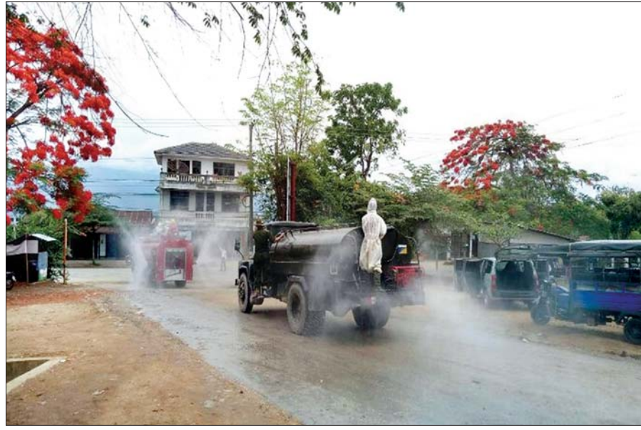
၃၀.၄.၂၀၂၀ ရက်က ရှမ်းပြည်နယ် ကျိုင်းတုံမြို့ပေါ်တွင် COVID-19 ကာကွယ်ဆေးဖျန်းစဉ်။