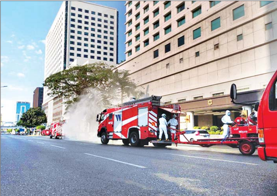
၃၀.၄.၂၀၂၀ ရက်က ရန်ကုန်တိုင်းဒေသကြီး ပန်းဘဲတန်းမြို့နယ် ဆူးလေဘုရားလမ်းတွင် COVID-19 ကာကွယ်ဆေးဖျန်းစဉ်။