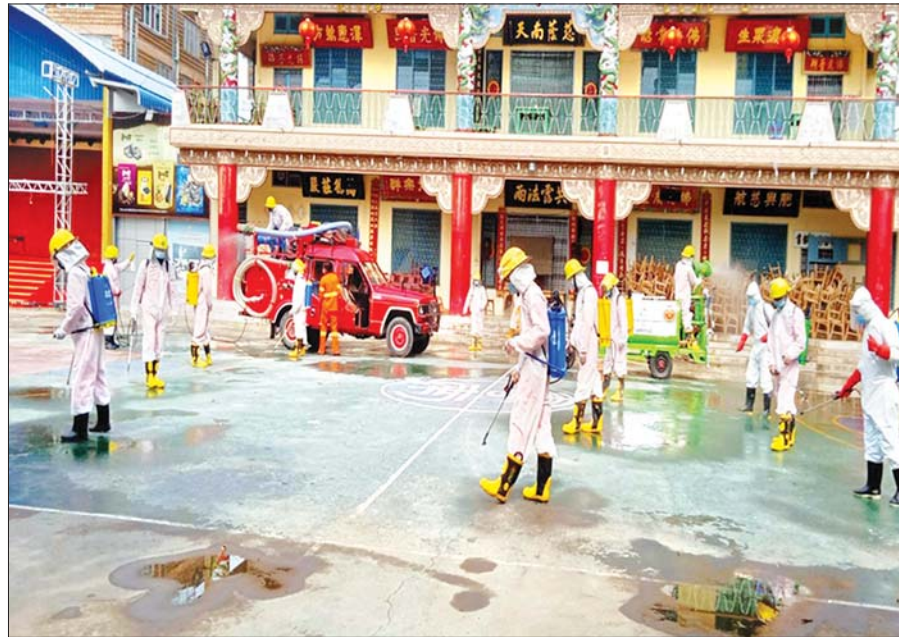
၃၀.၄.၂၀၂၀ ရက်က မန္တလေးတိုင်းဒေသကြီး ချမ်းအေးသာစံမြို့နယ် အောင်နန်းအရှေ့ရပ်ကွက် ယူနန်ဗုဒ္ဓဘာသာဘုရားကျောင်းတွင် COVID-19 ကာကွယ်ဆေးဖျန်းစဉ်။