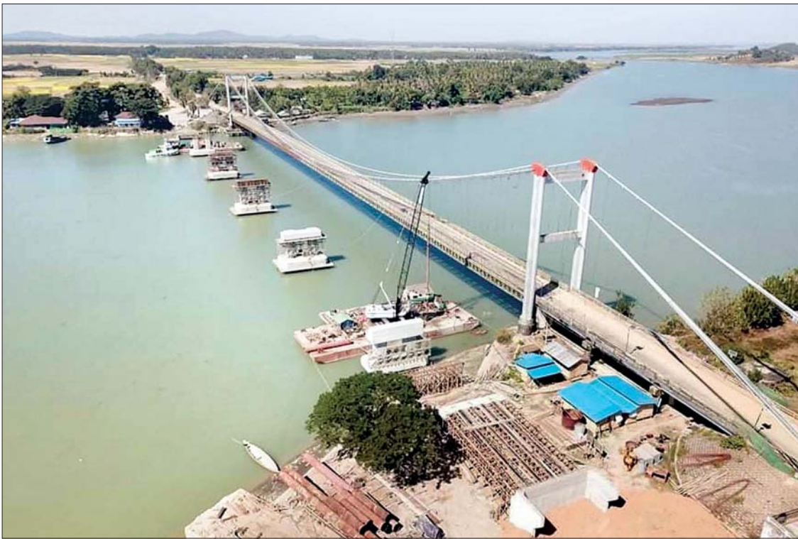
၂၀၁၉-၂၀၂၀ ဘဏ္ဍာရေးနှစ်တွင် မင်းဘူး-အမ်း-စစ်တွေလမ်းပေါ်ရှိ ရာမောင်တံတား(၁၂၈၄ ဒဿမ ၃ ပေ) တည်ဆောက်နေမှုကို တွေ့ရစဉ်။

ရခိုင်ပြည်နယ်အတွင်း e-ID လုပ်ငန်းစဉ် ဖြင့် တစ်ဦးချင်းစီ၏ Biographic ဆိုင်ရာ ကိုယ်ရေးအချက်အလက်များ ကောက်ယူခြင်း နှင့် Biometric နည်းဖြင့် မှတ်တမ်းတင်ခြင်း