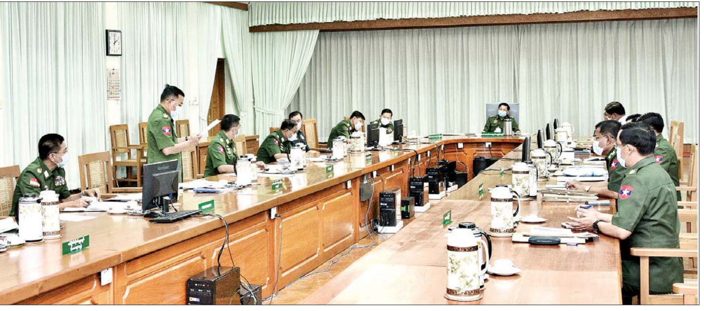
ကမ္ဘာ့ကပ်ရောဂါ ကိုဗစ် - ၁၉ ကာကွယ်ရေး၊ ထိန်းချုပ်ရေး၊ ကုသရေးနှင့် အခြားလိုအပ်ချက်များ ဆောင်ရွက်ပေးနိုင်ရေး ဆန္ဒမအကြိမ် ညှိနှိုင်းအစည်းအဝေး ကျင်းပစဉ်။

ထို့နောက် တပ်မတော်ကာကွယ်ရေးဦးစီးချုပ်က လက်ရှိအခြေအနေအထိ ကိုဗစ်-၁၉ ရောဂါဖြစ်ပွားမှု အခြေအနေကို ထိန်းချုပ်နိုင်ခြင်း မရှိသေးသဖြင့် Home Stay သာနေကြရန်၊ မဖြစ်မနေ အရေးကြီးသောကိစ္စရှိမှသာ အပြင်သို့ထွက်ခြင်း၊ ယာယီတာဝန်သွားခြင်းများ လုပ်ဆောင်ကြရန်လိုကြောင်း၊ ရောဂါကူးစက်မှုအန္တရာယ် ကြီးမားနိုင်သည့်အတွက် တပ်မတော်သားများသာမက တပ်တွင်း၊ တပ်ပြင်နေမိသားစုဝင်များ၊ စစ်မှုထမ်းဟောင်း များနှင့် မိသားစုဝင်များအနေဖြင့် အလုပ်ကိစ္စမရှိဘဲ အပြင်သို့ သွားလာခြင်းမပြုကြရန်နှင့် စည်းကမ်းထိန်းသိမ်း ကြရန်လိုကြောင်း၊ ရောဂါပိုး ရှိ မရှိ စစ်ဆေးနိုင်ရန် အရေး ကြီးသည့်အတွက် ယခုထက်ပိုမို စစ်ဆေးနိုင်မည့် နည်းလမ်း များ ဆောင်ရွက်ကြရန်လိုကြောင်း၊ မြန်မာစီးပွားရေး ကော်ပိုရေးရှင်းနှင့် မြန်မာ့စီးပွားရေးဦးပိုင် အများနှင့် သက်ဆိုင်သောကုမ္ပဏီလီမိတက်တို့ရှိ စက်ရုံ၊ အလုပ်ရုံ များ၊ တပ်မတော်ပိုင်စက်ရုံ၊ အလုပ်ရုံများတွင် သတ်မှတ် ချက်များအတိုင်း စစ်ဆေးမှုနှင့် စည်းကမ်းထိန်းသိမ်းမှု များကို တိတိကျကျ စစ်ဆေးကြပ်မတ်လိုက်နာကြရန် လိုကြောင်း။