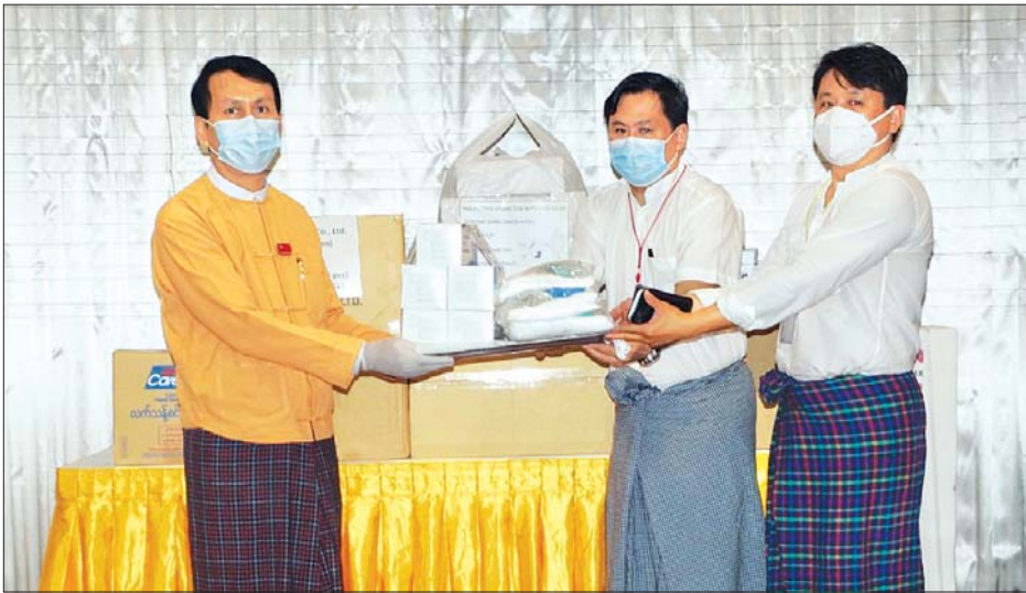
မေ ၅ ရက်က ကိုအောင်မိသားစု (D 2, Nino) အဝတ်အထည် အသုံးအဆောင်အရောင်းဆိုင်မှ MD ဦးသန်းထူးနှင့် ဦးအောင်ကျော်တို့က ရန်ကုန်တိုင်းဒေသကြီးအတွင်း ကိုဗစ် - ၁၉ ကာကွယ်၊ ထိန်းချုပ်၊ ကုသရေးလုပ်ငန်းများတွင် အသုံးပြုရန် ငွေကျပ် သိန်း ၂၅၀ တန်ဖိုးရှိ ပစ္စည်းများလှူဒါန်းရာ ရန်ကုန်တိုင်းဒေသကြီးဝန်ကြီးချုပ် ဦးဖြိုးမင်းသိန်း လက်ခံစဉ်။ သတင်းစဉ်