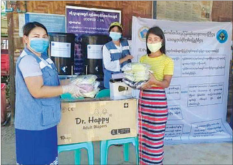
များအပြင် အသိပညာပေးလုပ်ငန်း ပေးမှုဆိုင်ရာ လုပ်ငန်းများကို တွင် စဉ်ဆက်မပြတ် ဆောင်ရွက်များ၊ အသိပေးနှိုးဆော်ခြင်းလုပ်ငန်း နေပြည်တော်ကောင်စီ အပါအဝင် လျက်ရှိကြောင်း သိရသည်။များနှင့် စိတ်ဓာတ်ရေးရာ မြှင့်တင် တိုင်းဒေသကြီး/ ပြည်နယ်အားလုံး သတင်းစဉ်

Handspaker ၁၄ ခု၊ ကိုဗစ်-၁၉ အသိပညာပေး အသံဖိုင် ထည့်သွင်းထားသော Memory Stick ၁၄ ခုတို့အား ထောက်ပံ့ခဲ့သည်။ အလားတူ ရှမ်းပြည်နယ် ကွတ်ခိုင်မြို့ရှိ နမ့်ဖက်ကာနှစ်ခြင်း အသင်းတော်နှင့် နမ့်ဖက်ကာ နယ်မြေ (၄) IDP စခန်း စုစုပေါင်း နှစ်ခုသို့ သွားရောက်၍ စခန်း တစ်ခုလျှင် ထုံး ၁၀ အိတ်နှုန်းဖြင့် စုစုပေါင်းထုံးအိတ် ၂၀ တို့အား ထောက်ပံ့ခဲ့သည်။ လူမှုဝန်ထမ်း၊ ကယ်ဆယ်ရေးနှင့် ပြန်လည်နေရာချထားရေး ဝန်ကြီးဌာနအနေဖြင့် ကိုဗစ်-၁၉ ရောဂါ ကာကွယ်၊ ထိန်းချုပ်၊ တုံ့ပြန်ရေးနှင့် ပတ်သက်၍ ထောက်ပံ့မှုလုပ်ငန်း