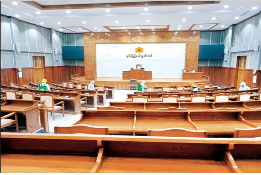
၃၀.၄.၂၀၂၀ ရက်က ချင်းပြည်နယ် ဟားခါးမြို့ လွှတ်တော်ရုံးတွင် COVID-19 ကာကွယ်ဆေးဖျန်းစဉ်။