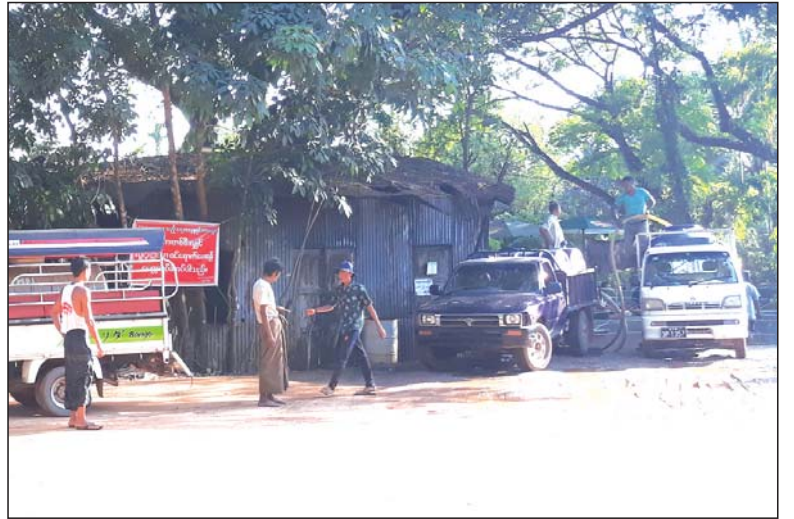
မွန်ပြည်နယ် သံဖြူဇရပ်မြို့နယ်တွင် ရေတွင်း၊ ရေကန်များ ရေခန်းခြောက်မှုများ ယခင်နှစ်များကထက်ပိုမိုဖြစ်ပေါ်ခဲ့ခြင်းကြောင့် ရပ်ကွက်၊ ကျေးရွာများတွင် ပြည်သူများသောက်သုံးရေ အခက်အခဲများရှိနေခဲ့ရာ စေတနာရှင်များပေးပို့သည့် ရေလှူဒါန်းရေးအဖွဲ့များမှ သံဖြူဇရပ်မြို့၌ သောက်သုံးရေလိုအပ်နေသည့် နေအိမ်များကို မေ ၇ ရက်က မြို့နယ်ရေပေးဝေရေးအဖွဲ့မှ သောက်သုံးရေများ လိုက်လံဖြည့်ဆည်းပေးစဉ်။