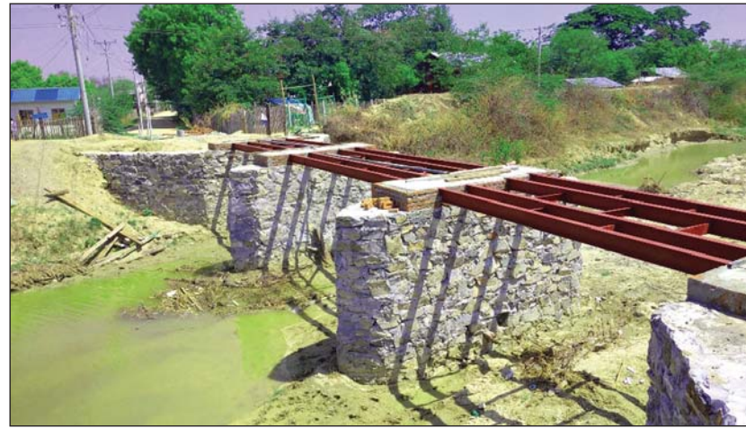
အောင်ရတနာတံတားတည်ဆောက်နေသည့်ကို တွေ့ရစဉ်

မိတ္ထီလာမြို့နှင့် ရှင်မြို့ကျေးရွာအပါအဝင် အုတ်နဲ့ပုတ်၊ ကျောက်ဖြူကုန်း၊ ဂဠုန်းကုန်း၊ ခါးကော့ကျေးရွာများနှင့် ဆက်သွယ်သွားလာသည့်လမ်းပေါ်ရှိ ရှင်မြို့ကျေးရွာ အောင်ရတနာတံတားမှာ မုန့်တိုင်ဆည်မှ မိတ္ထီလာကန်အတွင်း ရေစီးဝင်သည့် နတ်စင်ချောင်းပေါ်တွင် ဖြတ်သန်းဆောက်လုပ်ထားခြင်းဖြစ်သည်။ ၎င်းအောင်ရတနာတံတားကို ၂၀၁၆-၂၀၁၇ ခုနှစ်က ရှင်မြို့ကျေးရွာရှိ ဒေသခံပြည်သူများက စုပေါင်း၍ အလျား ပေ ၉၀ ရှိ သစ်သားတံတားကို ကိုယ့်အားကိုးတည်ဆောက်ခဲ့သော်လည်း အဆိုပါတံတားမှာ ခိုင်ခံ့မှုမရှိဘဲ ချောင်းရေကြီးပြီး ရေတိုက်စားသဖြင့် ပျက်စီးခဲ့၍ တံတားခိုင်ခံ့မှု ရှိစေရန် ဇန်နဝါရီလ ၂၃ ရက်က စတင်၍ ကျေးရွာသူ ကျေးရွာသားများ၏ စုပေါင်းထည့်ဝင်ငွေဖြင့် အလျား ပေ ၈၀၊ အကျယ် ၁၅ ပေရှိ သံကွန်ကရစ်တံတားကို တည်ဆောက်ခြင်းဖြစ်သည်။ ထိုသို့ သံကွန်ကရစ်တံတားကို တည်ဆောက်လျက်ရှိရာ