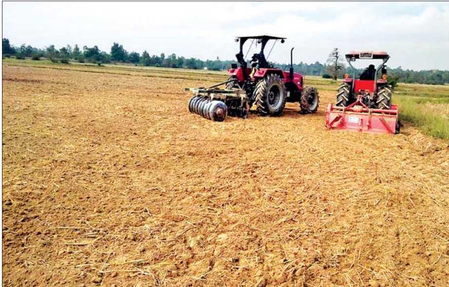
လာမည့် နွေစပါးနှင့် မိုးစပါးများ အချိန်မီထွန်းယက် မရွေး သင့်လျော်သောဈေးနှုန်းများဖြင့် အခက်အခဲမရှိ စိုက်ပျိုးရိတ်သိမ်းခြွေလှေ့လိုပါက လယ်ယာအထောက် ဝန်ဆောင်မှုပေးလျက်ရှိကြောင်း သိရသည်။

ကျေးရွာတွင် လယ်ယာမြေ ၁၆၂ ဒသမ ၅ ဧက၊ ထုံးအိုင် ကျေးရွာတွင် လယ်ယာမြေ ၁၇၁ ဧက၊ ဝင်းကြံကျေးရွာ တွင် လယ်ယာမြေ ၂၅၈ ဧက သံလှိုင်မြစ်အနောက်ဘက် ခြမ်း ကုန်းတန်းကြီးကျေးရွာတွင် လယ်ယာမြေ ၁၇၁ ဧက၊ ရေကျော်ကြီးကျေးရွာတွင် ဧက ၄၀၊ မြိုင်ကျေးရွာ တွင် လယ်ယာမြေ ၈၇ ဧက၊ လှိုင်ဘွဲ့မြို့နယ် နိုင်းပြ ကျေးရွာတွင် ၅၅ ဧက စုစုပေါင်း ၉၂၁ ဒသမ ၅ ဧကအား မြေယာပြုပြင်ခြင်းလုပ်ငန်းများ ဆောင်ရွက်ပေးခဲ့ပြီး ဘားအံမြို့နယ် ကော့ပုခော့၊ ခရားသံလှယ်၊ ကော့ပုခော့၊ ကျေးရွာများ၊ မွန်ပြည်နယ် ဘီလူးကျွန်း၊ ချောင်းဆုံ၊ ကမာကေးကျေးရွာ၊ ဘားအံမြို့နယ် ရွှေတောကျေးရွာ၊ လှိုင်ဘွဲ့မြို့နယ် နိုင်းပြကျေးရွာ၊ ကော့မြတ်ကြီး ကျေးရွာ များရှိ ၁၆၅၁ ဧကတို့အား ရိတ်သိမ်းခြွေလှေ့ခြင်းလုပ်ငန်း များ ဆောင်ရွက်လျက်ရှိပြီး တောင်သူလယ်သမားဦးကြီး များအနေဖြင့် မိမိတို့၏ လယ်ယာလုပ်ငန်းများမှ ထွက်ရှိ