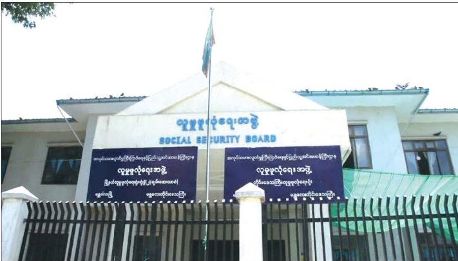
မန္တလေးမြို့၊ လူမှုဖူလုံရေးအဖွဲ့ရုံးကို တွေ့ရစဉ်

ကိုဗစ်-၁၉ ကာလအတွင်း လူမှုဖူလုံရေး အာမခံ လုပ်သားများ အကျိုးခံစားခွင့်များအနေဖြင့် အသွားအလာ ကန့်သတ်စောင့်ကြည့်နေရာဝင်ရမည့် အာမခံ အလုပ် သမားများအတွက် ၂၈ ရက် ခံစားခွင့်ပေးမှာ ဖြစ်ပြီး