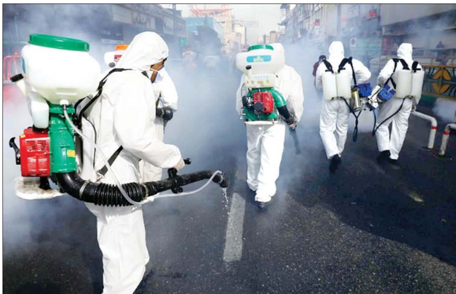
အီရန်ကျန်းမာရေးဝန်ထမ်းများက ဗိုင်းရပ်စ်ကာကွယ်ရေးအတွက် ဆေးဖျန်းခြင်းဆောင်ရွက်နေစဉ်။