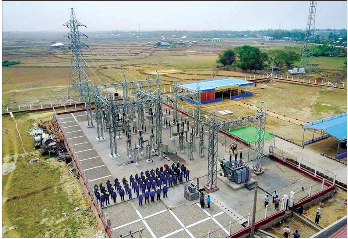
၆၆/၁၁ ကေစီ၊ ၅ အမ်ပီအေ ရသေ့တောင် ဓာတ်အားခွဲရုံ တည်ဆောက်ပြီးစီးမှုကို တွေ့ရစဉ်။

ရခိုင်ပြည်နယ်၏ သမိုင်းဝင်ယဉ်ကျေးမှု အမွေအနှစ်ဒေသဖြစ်သည့် မြောက်ဦး ယဉ်ကျေးမှု အမွေအနှစ်ဒေသကို ကမ္ဘာ့အမွေ အနှစ်စာရင်း တင်သွင်းရေးအတွက် ပြည်တွင်း၊ ပြည်ပ ပညာရှင်များ၊ ဌာနဝန်ထမ်းများနှင့် UNESCO မှ ပညာရှင်များ ညှိနှိုင်းပူးပေါင်း၍ ၂၀၁၉ ခုနှစ် စက်တင်ဘာလ ၂၄ ရက်တွင် Nomination Dossier Draft (မူကြမ်း) တင်သွင်းခဲ့ပြီး ၂၀၂၀ ပြည့်နှစ် ဇန်နဝါရီလ ၂၇ ရက်တွင် အဆိုပါမူကြမ်းကို ပြင်သစ်နိုင်ငံ ပါရီမြို့ရှိ ကုလသမဂ္ဂပညာရေး၊ သိပ္ပံနှင့် ယဉ်ကျေးမှုအဖွဲ့ (UNESCO) သို့ တင်ပြထား ပြီးဖြစ်သည်။ အချုပ်ပိုင် (က) သို့