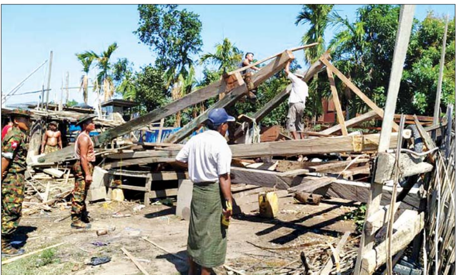
ဘေးအန္တရာယ်ဆိုင်ရာ စီမံခန့်ခွဲမှုဦးစီးဌာနမှ ဆန်ရိက္ခာဖိုး၊ အိမ်ဆောက်ပစ္စည်းဖိုး၊ ကယ်ဆယ်ရေးပစ္စည်းဖိုးများ ထောက်ပံ့ခြင်းများအတွက် စုစုပေါင်း ငွေကျပ် ၃၂၉ ဒသမ ၁ သန်းကျော် ထောက်ပံ့ခဲ့ပြီးဖြစ်ပါသည်။

ဧပြီ ၉ ရက်မှ မေ ၇ ရက်အထိ မြန်မာနိုင်ငံတစ်ဝန်း၌ လေပြင်းတိုက်ခတ်မှုများကြောင့် နေအိမ် ၃၇၇ လုံးနှင့် ဘာသာရေးအဆောက်အအုံ ၁၃ လုံး ပြိုကျပျက်စီးခြင်း၊ နေအိမ် ၅၉၈၂ လုံးနှင့် ဘာသာရေးအဆောက်အအုံ ၁၂၄လုံး အမိုးအကာလန်ပျက်စီးခြင်းများဖြစ်ခဲ့ပြီး လူမှုဝန်ထမ်း၊ ကယ်ဆယ်ရေးနှင့် ပြန်လည်နေရာချထားရေးဝန်ကြီးဌာန