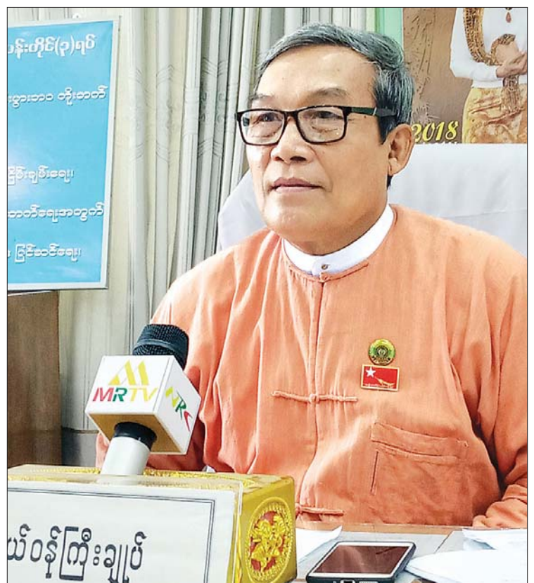
ရခိုင်ပြည်နယ်ဝန်ကြီးချုပ် ဦးညီပု