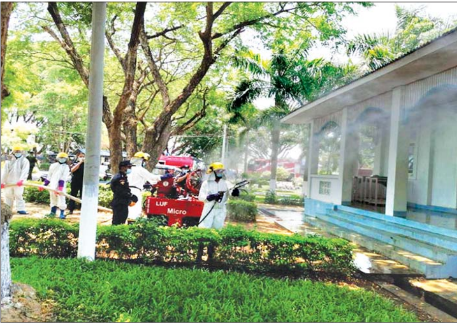
၃၀.၄.၂၀၂၀ ရက်က နေပြည်တော် စည်ပင်သာယာရေးကော်မတီ ဧည့်ရိပ်သာ(၁)တွင် COVID-19 ကာကွယ်ဆေးဖျန်းစဉ်။