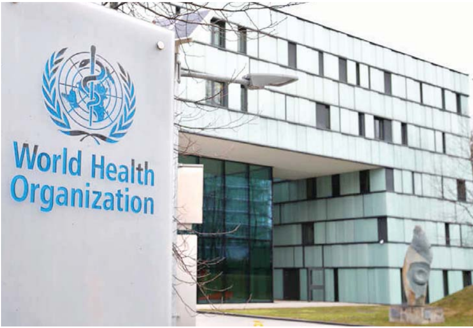
ကမ္ဘာ့ကျန်းမာရေးအဖွဲ့ ရုံးချုပ်ကို တွေ့ရစဉ်။