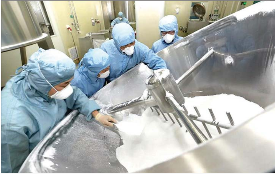
တရုတ်နိုင်ငံ ကျီအန်စုပြည်နယ်ရှိ ဆေးဝါးထုတ်လုပ်ရေး စက်ရုံတစ်ရုံမှ ဝန်ထမ်းများ လုပ်ငန်းခွင်

“လက်ရှိ ထုတ်လုပ်ထားတဲ့ အဗီဂန်ဆေး အရေ အတွက်ကို သုံးဆလောက်အထိ ထပ်တိုးထုတ်လုပ် ဖို့အတွက် ၎င်းက ငွေကြေး အမေရိကန်ဒေါ်လာ သန်း ၁၃၀ နီးပါးအထိ သုံးစွဲဖို့ ခွဲဝေသတ်မှတ်ထားတယ် လို့လည်း သိရ”