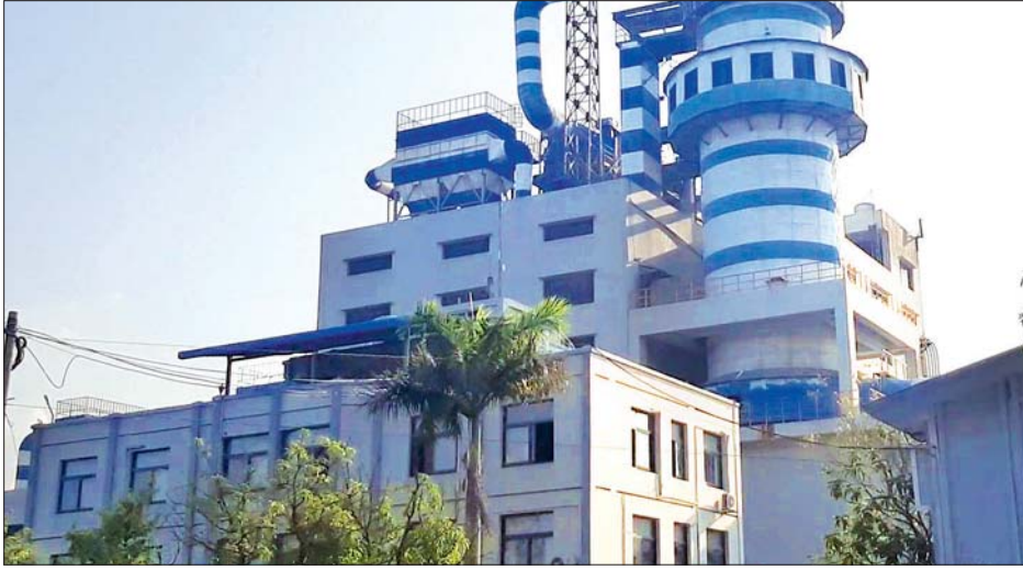
မန္တလေးစက်မှုဇုန်ရှိ စက်ရုံတစ်ရုံ။

အကြီးစား၊ အလတ်စား၊ အသေးစား လုပ်ငန်းများတွင် စက်ရုံ၊ အလုပ်ရုံ ၁၁၈၀ ရှိရှိပြီး စစ်ဆေးခံရန် တင်ပြထားသော စက်ရုံအလုပ်ရုံ ၁၅၀ ရှိကာ ပြန်လည်ဖွင့်လှစ် လည်ပတ်ခွင့်ပြု ထားသည့် စက်ရုံ၊ အလုပ်ရုံ ၇၂ ရှိရှိကြောင်း သိရသည်။