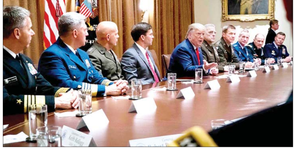
အမေရိကန်သမ္မတ ဒေါ်နယ်ထရမ် အစိုးရအဖွဲ့ဝင်များနှင့် ဆွေးနွေးနေစဉ်။

ထိုပြင် သမ္မတထရမ်က ၎င်း၏ စစ်ရေးဆုံးဖြတ်ခွင့်ကို ကန့်သတ်ရန် ရေးဆွဲလိုက်သည့် ယင်းဆုံးဖြတ်ချက် ကို မဲပေးခဲ့ကြသည့် ရီပတ်ဘလစ် ကန်အမတ်အနည်းစုတို့မှာ ဒီမိုကရက် ပါတီဝင်များ၏ လက်ခုပ်အတွင်း ဆော့ကစားခံနေရသူများဖြစ်ကြောင်း ထပ်မံပြောကြားလိုက်သည်။ အဆိုပါ ဆုံးဖြတ်ချက်သည် အမေရိကန် ပြည်ထောင်စုကို အကာအကွယ်ပေး ရန် သမ္မတတစ်ဦး၏ ကြိုးပမ်း အားထုတ်မှုစွမ်းရည်ကို ထိခိုက် အားနည်းစေရုံသာမက အမေရိကန်၏ မဟာမိတ်အဖွဲ့ဝင်များနှင့် လုပ်ဖော် ကိုင်ဖက်များကိုပါ ကာကွယ်နိုင်စွမ်း ဆုတ်ယုတ်စေလိမ့်မည်ဖြစ်ကြောင်း၊ ယင်းကဲ့သို့သော ဆုံးဖြတ်ချက်မျိုးကို အထက်လွှတ်တော်က ခွင့်ပြုပေး ခဲ့သင့်ကြောင်း သမ္မတထရမ်က ပြောကြားလိုက်သည်။ ဆင်ပွာ