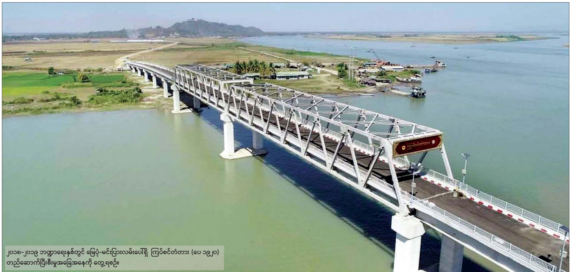
၂၀၁၈-၂၀၁၉ ဘဏ္ဍာရေးနှစ်တွင် မြေပုံ-မင်းပြားလမ်းပေါ်ရှိ ကြပ်စင်တံတား (ပေ ၁၉၂၀) တည်ဆောက်ပြီးစီးမှုအခြေအနေကို တွေ့ရစဉ်။