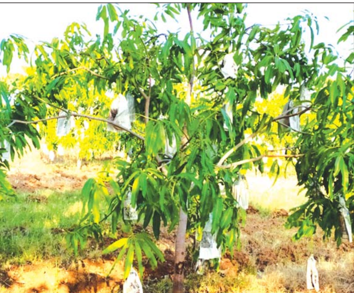
ပုပ္ပားဒေသမှ စိန်တလုံးသရက်ပင်များကို တွေ့ရစဉ်