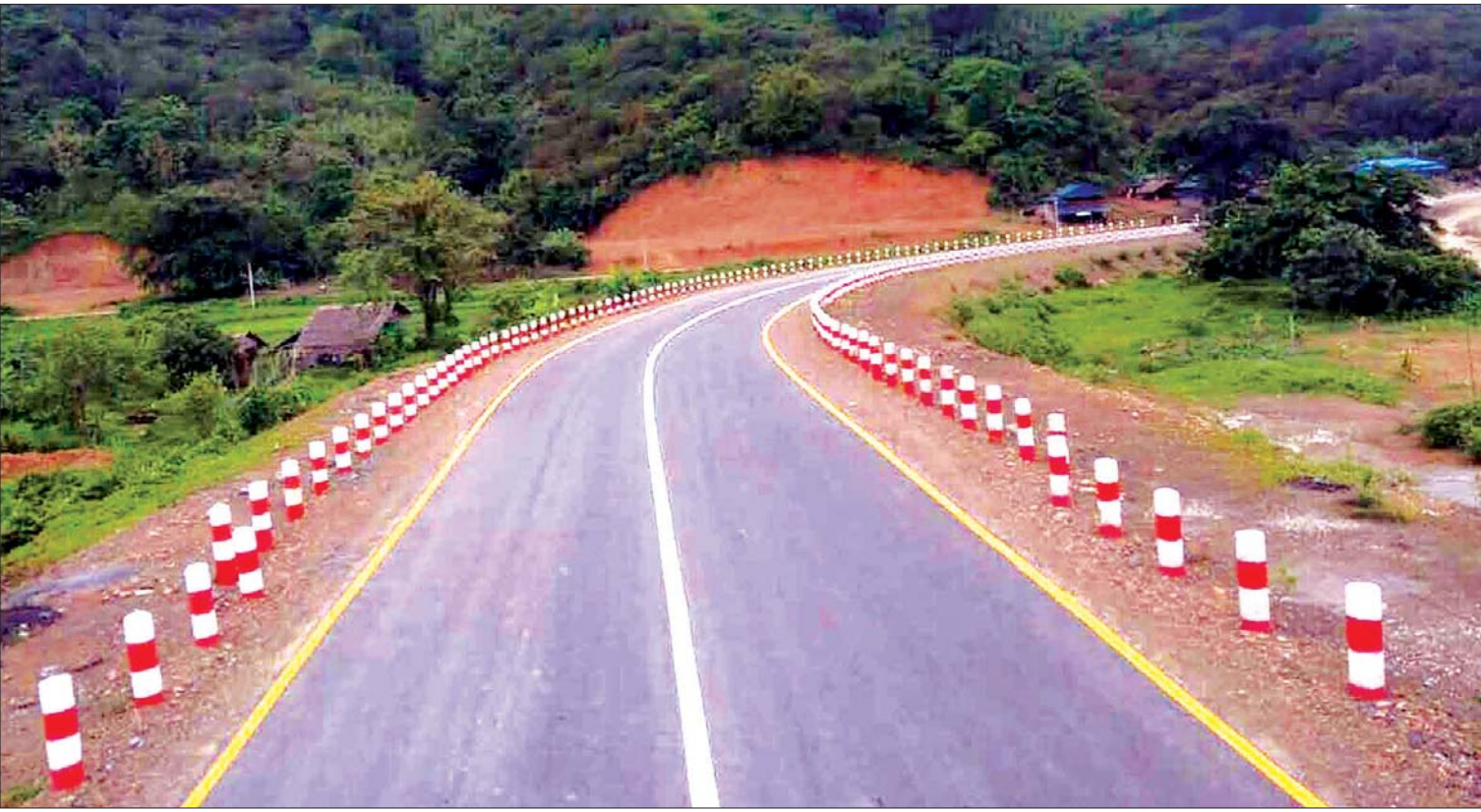
၂၀၁၈-၂၀၁၉ ဘဏ္ဍာရေးနှစ်တွင် မင်းဘူး-အမ်း-စစ်တွေ ကဏ္ဍရာ ကွန်ကရစ်လမ်းခင်းခြင်း ဆောင်ရွက်ပြီးစီးမှုကို တွေ့ရစဉ်။

ODA Loan ချေးငွေကျပ် ၁၀၃ သန်းဖြင့် ရဲမာန်ကုမ္ပဏီမှ ကန်တော်ကြီး ရေစစ်ကန်နှင့် ကန်ပိုင်ရေစစ်ကန်တွင် Blower System ကို ၁၀၀ ရာခိုင်နှုန်း ဆောင်ရွက်ပြီးဖြစ်သည်။