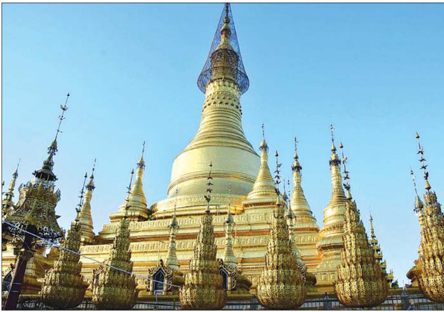
ပြည်မြို့သမိုင်းဝင် ရွှေဆံတော်ဘုရား။

အချို့မှာမူ သရေခေတ္တရာပြည်ကြီး ပျက်စီးပြီးနောက်