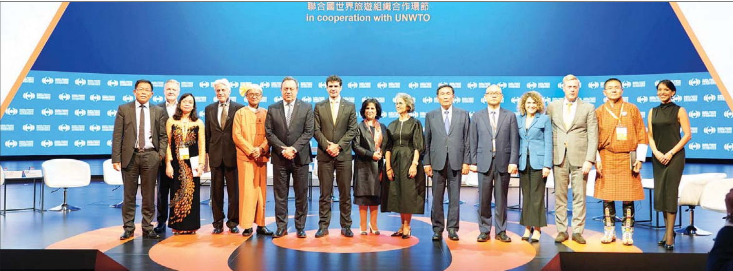
ပြည်ထောင်စုဝန်ကြီး ဦးအုန်းမောင် ၂၀၁၉ ခုနှစ် အောက်တိုဘာလက ကမ္ဘာ့ခရီးသွားလုပ်ငန်းအဖွဲ့ချုပ်နှင့် မကာဆီအစိုးရ လူမှုရေးနှင့် ယဉ်ကျေးမှုဌာနတို့ကြီးမှူး၍ မကာဆီအထူးအုပ်ချုပ်ရေးဒေသ၌ ကျင်းပသည့် Face to Face-Ministers and Private Sector CEOs: How Tourism, Leisure and Sports lead to a Beautiful Life - Panel Discussion ဆွေးနွေးပွဲသို့ တက်ရောက်ကြသူများနှင့် စုပေါင်း မှတ်တမ်းတင် ဓာတ်ပုံရိုက်စဉ်။

နောက်ထပ် ကျေးရွာပေါင်း ၁၀ ရွာပါဝင်တဲ့ CBT Site ခုနစ်ခုကို ဆက်လက်ဖော်ထုတ်နိုင်ရေး စီစဉ်ဆောင်ရွက်လျက်ရှိပါတယ်။ လူထုအခြေပြုခရီးသွားလုပ်ငန်း ဆောင်ရွက်ရာမှာ နိုင်ငံတစ်ဝန်း နိုင်ငံတကာအဆင့်မီစေဖို့အတွက် လုပ်ဆောင်ရမယ့် စံချိန်စံညွှန်းတွေ အသေးစိတ်ပါဝင်တဲ့ မြန်မာလူထုအခြေပြု ခရီးသွားလုပ်ငန်းစံသတ်မှတ်ချက်များ (Myanmar Community Based Tourism Standards) ကို ၂၀၁၉ ခုနှစ် စက်တင်ဘာလ ၂၇ ရက် ကမ္ဘာ့ခရီးသွားလုပ်ငန်းနေ့မှာ စတင်အသုံးပြုဖို့ ထုတ်ပြန်နိုင်ခဲ့ပါတယ်။ စာရင်းစာယူတွေအရ ၂၀၁၉ ခုနှစ် ဒီဇင်ဘာလအထိ လူထုအခြေပြု