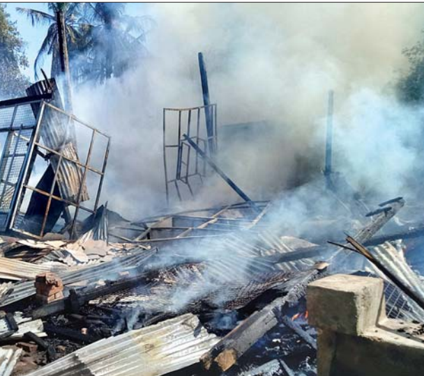
မီးလောင်ပျက်စီးသွားသည့် နေအိမ်အဆောက်အအုံများ။

ဟင်္သာတ မေ ၄ ဧရာဝတီတိုင်းဒေသကြီး ဟင်္သာတမြို့ သုံးပင်ကွင်းရပ်ကွက် ကန်သာယာ(၁)လမ်းတွင် ယနေ့ မွန်းလွဲ ၃ နာရီ ၀၀ မိနစ် ၁၀ နှစ်က မီးလောင်မှုဖြစ်ပွားခဲ့သည်။ မီးလောင်မှုဖြစ်ရာသို့ ဟင်္သာတခရိုင် မီးသတ်ဦးစီးမှူး ဦးစိုးနေောင်ကြီးကြပ်မှုဖြင့် ခရိုင်မီးသတ်တပ်ဖွဲ့မှ မီးသတ် ယာဉ်နှစ်စီး၊ မြို့နယ်မီးသတ်တပ်ဖွဲ့မှ မီးသတ်ယာဉ်နှစ်စီးနှင့် သန္ဓေနှင့် အရန်မီးသတ်တပ်ဖွဲ့များ၊ ရပ်ကွက်နေပြည်သူများ၊