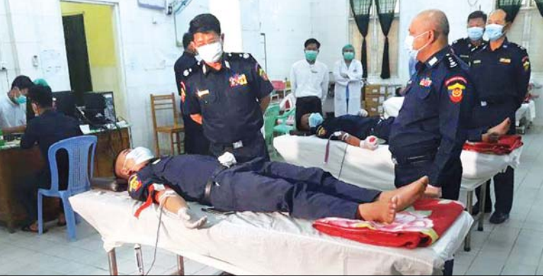
မြင်းငြိမ်း

နေပြည်တော် မေ ၄ (၇၄) နှစ်မြောက် မြန်မာနိုင်ငံမီးသတ်တပ်ဖွဲ့နေ့ကို ဂုဏ်ပြုသောအားဖြင့် နေပြည်တော်၊ တိုင်းဒေသကြီး၊ ပြည်နယ်များမှ သူငယ်များအားလုံးပါ အသင်းအဖွဲ့အစည်းများက ဆွမ်း ဆက်ကာပွဲအဖြစ် ပြုလုပ်ခဲ့ပြီး သွေးလှူဘဏ်နှင့် ဆေးရုံများသို့ စုပေါင်းသွေးလှူခြင်းနှင့် သန့်ရှင်းရေးလုပ်ငန်းများ ဆောင်ရွက်ခြင်း၊ ဘုရား၊ စေတီပုထိုးများကို ရေသပ္ပာယ်ပူဇော်ခြင်း၊ ဘုန်းကြီးကျောင်းများနှင့် ဘိုးဘွားရိပ်သာများတွင် သန့်ရှင်းရေးလုပ်ငန်းများဆောင်ရွက်ခြင်း စသည့် ပြည်သူ့အကျိုးပြုလုပ်ငန်းများကို ယနေ့တွင် တစ်နိုင်ငံလုံး၌ ဆောင်ရွက်ကြသည်။ ထိုသို့ဆောင်ရွက်ရာတွင် (၇၄) နှစ်မြောက် မြန်မာနိုင်ငံမီးသတ်တပ်ဖွဲ့နေ့ကို ဂုဏ်ပြုသော အားဖြင့် မေ ၂ ရက်မှစတင်၍ နေပြည်တော်အပါအဝင် တိုင်းဒေသကြီး၊ ပြည်နယ်များရှိ မြို့နယ် ၁၅၄ မြို့နယ်ရှိ သွေးလှူဘဏ်နှင့် ဆေးရုံများ၌ သန့်ရှင်းရေးလုပ်ငန်းများနှင့် အရန်မီးသတ်တပ်ဖွဲ့ဝင် ၃၅၁ ဦးတို့က သွေးပူလင်းပေါင်း ၁၄၄၁ ပူလင်းလှူဒါန်းခဲ့ကြကြောင်း မီးသတ်ဦးစီးဌာနမှ သိရသည်။ (အောက်ပုံ)