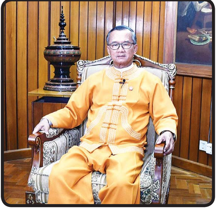
ပြည်ထောင်စုဝန်ကြီး ဦးအုန်းမောင်

ဝန်ကြီးဌာနရဲ့ အချက်အလက်တွေအရ ၂၀၁၆ ခုနှစ်မှာ ဟိုတယ်နဲ့ တည်းခိုခန်းပေါင်း ၁၄၃၂ လုံးနဲ့ အခန်းအရေ အတွက် ၅၆၀၀၀ ကျော်ရှိခဲ့ရာကနေ ၂၀၁၉ ခုနှစ်မှာ ဟိုတယ် နဲ့ တည်းခိုခန်းပေါင်း ၁၉၈၄ လုံးနဲ့ အခန်းအရေအတွက် ၈၀၀၀ နီးပါးအထိ တိုးတက်လာခဲ့ပါတယ်။ ၂၀၁၆ ခုနှစ် မှာ ခရီးလှည့်လည်ရေးလုပ်ငန်း ၂၄၅၃ ခုကနေ ၂၀၁၉ ခုနှစ် မှာ ၃၁၈၈ ခုအထိ တိုးတက်ခဲ့ပါတယ်။ ၂၀၁၆ ခုနှစ်မှာ လိုင်စင်ရညွှန်းလမ်းညွှန် ၇၀၀၀ နီးပါးကနေ ၂၀၁၉ ခုနှစ်မှာ ၉၀၀၀ ကျော်အထိ တိုးတက်ခဲ့ပါတယ်။