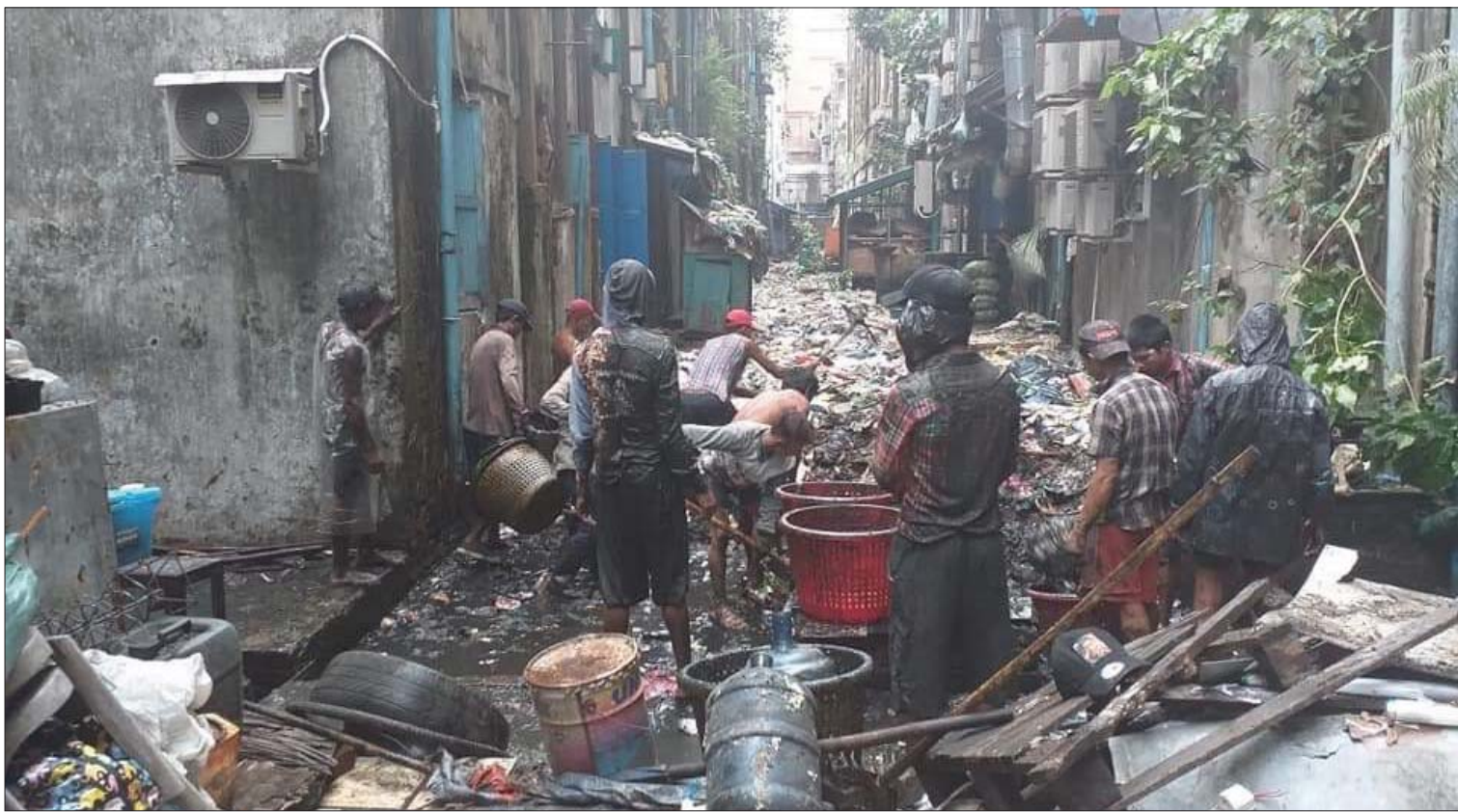
နောက်ဖေးလမ်းကြားများတွင် စွန့်ပစ်အမှိုက်များ ရှင်းလင်းဖယ်ရှားစဉ်။

မ ပင့်မဖိတ်ဘဲ နွေခေါင်ခေါင် မတ်လစတုတ္ထ ပတ်ထဲက မြန်မာပြည်ကို ရောက်လာခဲ့တဲ့ ကိုဗစ်-၁၉ က အခုဆို တစ်လ ကျော်ကျော်ရှိနေပြီဆိုရမှာ ဖြစ်ပါတယ်။ တစ်လကျော်အတွင်း ရောဂါပိုးပျံနှံမှု ကလည်း မေ ၄ ရက် ၂၀၂၀ နာရီ ၁၀ တန်း ထုတ်ပြန်ချက်အရ ရောဂါပိုးတွေ့ရှိသူ ၁၆၁ ဦး ရှိခဲ့ပြီး အဲဒီထဲက ပြန်လည်ကောင်းမွန်၍ ဆေးရုံ မှ ဆင်းခွင့်ရရှိသူ ၂၉ ဦးရှိနေပါပြီ။ သေဆုံးသူ ခြောက်ဦးသာ ရှိခဲ့ပါတယ်။ နိုင်ငံတော်က တာဝန်ရှိသူတွေရဲ့ အဆိုအရ ပထမလှိုင်းအဆင့် မှာပဲ ရှိနေပါသေးတယ်။ နောက်ထပ်လှိုင်းလုံး များကို ဘယ်လောက်ကြာကြာဖြတ်ကျော်ရ ဦးမှာလဲဆိုတာ ဘယ်သူမှ မပြောနိုင်တဲ့ အနေအထားပါ။ မိုင်ပေါင်းများစွာရှည်လျားတဲ့ ပြေးလမ်းပေါ်က တာဝေးအပြေးသမားလိုပါပဲ။ ရေရှည်အမောလုံဖို့ လိုပါလိမ့်မယ်။