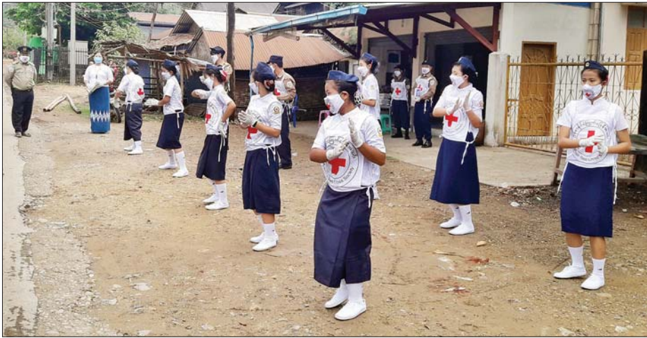
သထုံမြို့၌ ကိုဗစ်-၁၉ ကူးစက်မှုလျှော့ချရေး ပညာပေးလှုပ်ရှားမှုဆောင်ရွက်စဉ်။

သထုံ မေ ၄ မွန်ပြည်နယ် သထုံမြို့နယ်တွင် ကြက်ခြေနီမောင်မယ်များက ဌာနဆိုင်ရာများ၊ လူမှုရေးအဖွဲ့များနှင့် ပူးပေါင်းကာ ကိုဗစ်-၁၉ ပညာပေးတေးသီချင်းများဖြင့် သရုပ်ပြဖော်ပြခြင်း ပညာပေးလှုပ်ရှားမှုများကို လူစည်ကားရာ နေရာများ၌ မေ ၃ ရက်က စတင်ကာ နှစ်ပတ်ကြာနေ့စဉ် ပြုလုပ်မည်ဖြစ်ကြောင်း မြို့နယ်ကြက်ခြေနီအသင်းခွဲမှ သိရသည်။