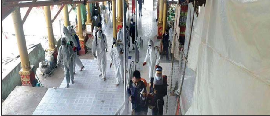
၂၈-၄-၂၀၂၀ ရက်က ပဲခူးမြို့ပေါ်ရှိ ဟင်္သာကုန်းဘုရားတွင် ပဲခူးတပ်နယ်မှူးနှင့် ပဲခူးတိုင်းဒေသကြီး မီးသတ်တပ်ဖွဲ့ဝင်များ ပူးပေါင်း၍ COVID-19 ကာကွယ်ဆေးဖျန်းစဉ်။