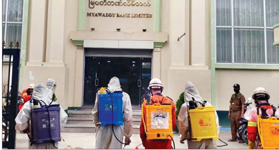
၂၈-၄-၂၀၂၀ရက်က ပြည်ကြီးတံခွန်မြို့နယ်ရှိ မြဝတီဘဏ်လီမိတက်တွင် အမှတ်(၂)ပင်မအလုပ်ရုံ၊ လျှပ်စစ်နှင့် စက်ပစ္စည်းအလုပ်ရုံ (ပလစ-၂)မှ အရာရှိ၊ စစ်သည်များ ပြည်ကြီးတံခွန်မြို့နယ် မီးသတ်တပ်ဖွဲ့ဝင်များ ပူးပေါင်း၍ COVID-19 ကာကွယ်ဆေးဖျန်းစဉ်။