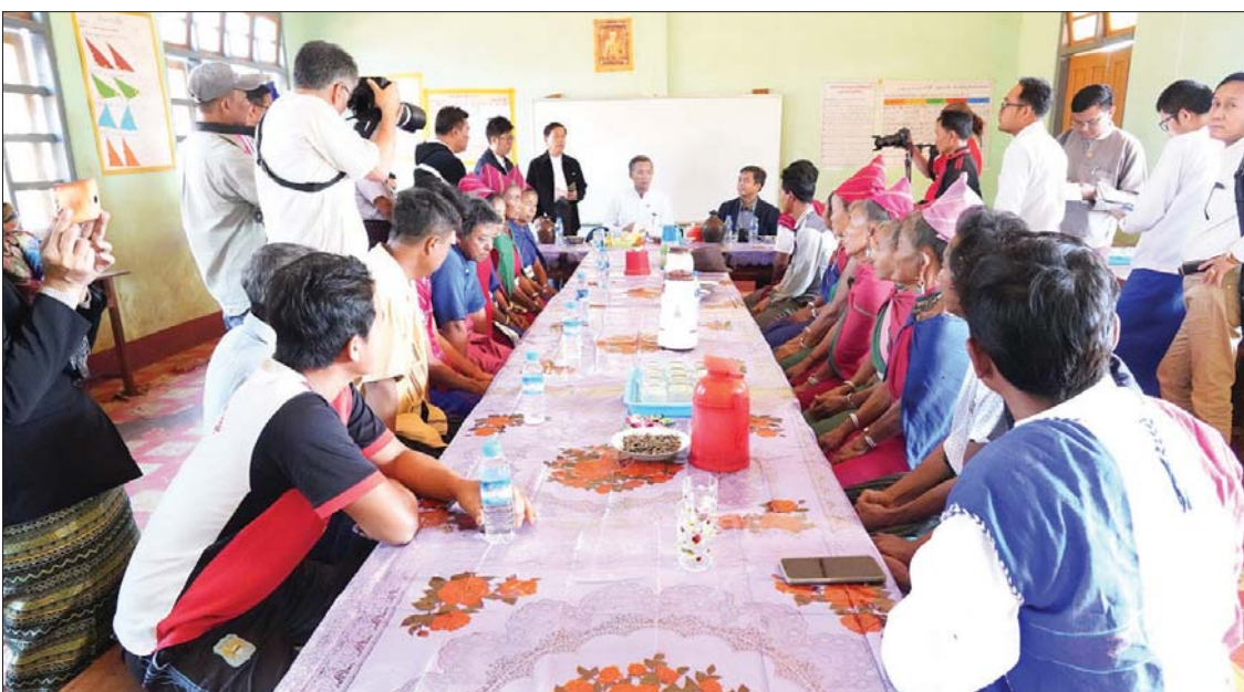
ကယားပြည်နယ်၌ ခရီးသွားလုပ်ငန်းဖွံ့ဖြိုးတိုးတက်စေရန် ရပ်ရွာလူထုအခြေပြု ခရီးသွားလုပ်ငန်း CBT ဖွင့်လှစ်ဆောင်ရွက်စဉ်။

မန္တလေးတိုင်းဒေသကြီး အတွင်းက ခရီးသွားလုပ်ငန်းတွေနဲ့ ပြည်တွင်းခရီးသွား လုပ်ငန်းတွေ ပိုမိုမြင့်တက်လာစေဖို့နဲ့ ပိုမို