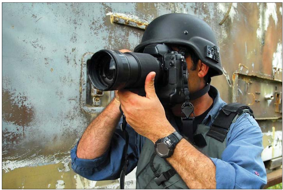
ဂျာနယ်လစ်တစ်ဦးကို တွေ့ရစဉ်။