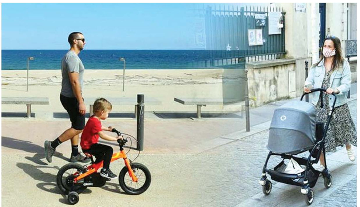
စပိန်၌ ကလေးငယ်များအား ကန့်သတ်ပိတ်ဆို့မှု ဖြေလျှော့ပေးခဲ့ပြီးနောက် မိဘများက ၎င်းတို့ကလေးငယ်များကို အပြင်ထွက်၍ ထိန်းကျောင်းနေစဉ်။

သို့သော်လည်းပဲ မေ ၃ ရက်မှာ ပြင်သစ်ကျန်းမာရေးဝန်ကြီး အိုလီဗီယာ ဗီရန်က ကန့်သတ်ပိတ်ဆို့မှု ဖယ်ရှားပေးဖို့အခြေအနေဟာ ရောဂါထပ်မံ ကူးစက်ဖြစ်ပွားမှု အရေအတွက်အပေါ်မှာ အထူးသဖြင့် ပါရီနဲ့ ပြင်သစ်နိုင်ငံ အရှေ့မြောက်ပိုင်းမှာရှိတဲ့ ရောဂါကူးစက်မှု အဆိုးဆုံးထိခိုက်ခံစားရတဲ့နေရာ တွေက အခြေအနေတွေအပေါ် အထူးသတိထားစောင့်ကြည့်ပြီးမှသာ လမ်းညွှန်ချက်တွေ ဖယ်ရှားဖို့သင့်မသင့် သုံးသပ်မှာဖြစ်တယ်လို့ ဆိုပါတယ်။