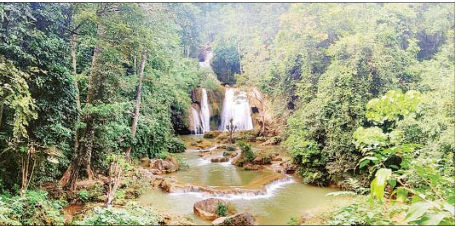
မန္တလေးတိုင်းဒေသကြီး ပြင်ဦးလွင်မြို့နယ်ရှိ ပိတ်ချင်းမြောင်းရေတံခွန်ကို တွေ့ရစဉ်။

ရန်ကုန်တိုင်းဒေသကြီးမှာ Bed and Breakfast လုပ်ငန်းလိုင်စင်တစ်ခုကို တိုင်း ဒေသကြီးအစိုးရအဖွဲ့ရဲ့ ကြီးကြပ်မှုနဲ့ ထုတ်ပေး ပါဆိုပြီး ခွင့်ပြုပေးခဲ့လို့ Hostel လုပ်ငန်း လိုင်စင်ထုတ်ပေးနိုင်ခဲ့ပါတယ်။ ဒီအချိန်မှာ ခရီးသွားဥပဒေပြဋ္ဌာန်းနိုင်ခဲ့ပြီး နည်းဥပဒေ တွေ ထွက်လာခဲ့ပါတယ်။ တိုင်းဒေသကြီး အတွင်း ဒေသဆိုင်ရာ ခရီးသွားကော်မတီ တွေကို ဖွဲ့စည်းနိုင်ခဲ့ပါတယ်။ ရန်ကုန်တိုင်း ဒေသကြီးမှာ ဟိုတယ်၊ မိုတယ် စတဲ့လုပ်ငန်း လိုင်စင်ပေါင်းက တစ်နိုင်လုံး အတိုင်းအတာ နဲ့ဆိုရင် အများဆုံးရှိပါတယ်။ စီးပွားရေး လုပ်ငန်းအများစုက ရန်ကုန်မှာရှိလို့ လုပ်ငန်း လိုင်စင်တွေကို မြန်မြန်ဆန်ဆန် ထုတ်ပေးနိုင် အောင် ကြိုးစားနေပါတယ်။