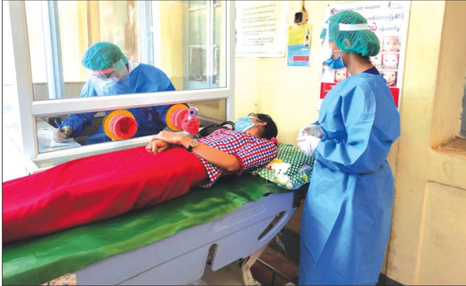
သန်လျင်၌ ဖွင့်လှစ်ထားသည့် ဈေးနာကု သီးခြားဆေးခန်း၌ ကုသပေးနေစဉ်

ရန်ကုန် မေ ၄ ရန်ကုန်တောင်ပိုင်းခရိုင် သန်လျင်မြို့နယ် ကိုဗစ်-၁၉ ကာကွယ်ထိန်းချုပ်ရေးနှင့် အရေးပေါ် တုံ့ပြန်ရေးကော်မတီသည် မြို့နယ်အတွင်း ရောဂါပိုးပျံ့နှံ့မှုမရှိစေရေးအတွက် ပြည်သူ့ကျန်းမာရေးဦးစီးဌာနမှ ပေးဆောင်လျက်ရှိရာ ကိုဗစ်-၁၉ ကြောင့် ပြင်ပဆေးခန်းများ ပိတ်ထားရချိန်တွင် သာမန်ဈေးနာ လူနာများအား ကုသပေးနိုင်ရန် Fever Clinic ဆေးခန်းကိုသန်လျင်အထွေထွေရောဂါကုဆေးရုံကြီးပြင်ပလူနာဌာနဆေးကုသဆောင်အနီး၌ မေ ၄ ရက်က စတင်ဖွင့်လှစ် ကုသလျက်ရှိသည်။ အဆိုပါ ဆေးခန်းဖွင့်လှစ်ကုသနိုင်ရေးအတွက်ကျန်းမာရေးနှင့်အားကစားဝန်ကြီးဌာန၏ ထုတ်ပြန်ထားသည့် ညွှန်ကြားချက်များနှင့်အညီ လွှတ်တော်ကိုယ်စားလှယ်များ၊ ဌာနဆိုင်ရာများ၊ အလှူရှင်များ၊ ပရဟိတအဖွဲ့များ၏ ပံ့ပိုးကူညီမှုဖြင့် ပြည်သူ့ကျန်းမာရေးနှင့် ကုသရေးဦးစီးဌာနက ကြီးကြပ်ဆောင်ရွက် ပေးလျက်ရှိသည်။ ဈေးနာကုသီးခြား ဆေးခန်းဖွင့်လှစ်ခြင်းနှင့်စပ်လျဉ်း၍ သန်လျင်အထွေထွေရောဂါကု ဆေးရုံအုပ်ကြီး