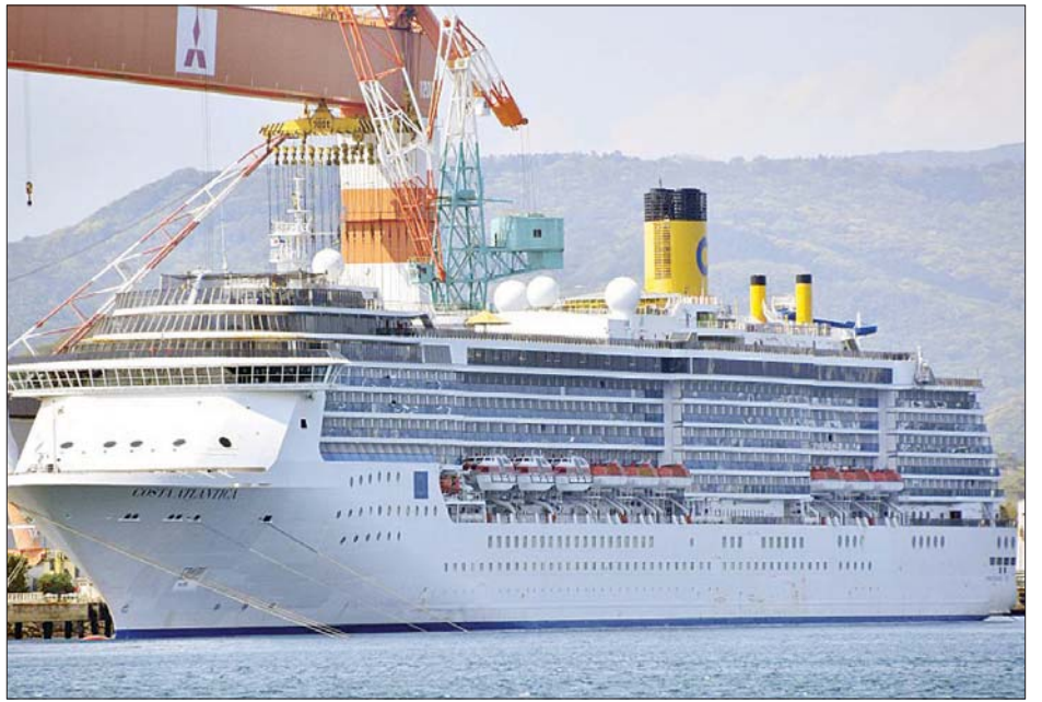
ဂျပန်နိုင်ငံအနောက်တောင်ပိုင်းတွင် ကျောက်ချရပ်နားထားသည့် ကိုစတာအက်တလန်တီကာသင်္ဘောကို တွေ့ရစဉ်။