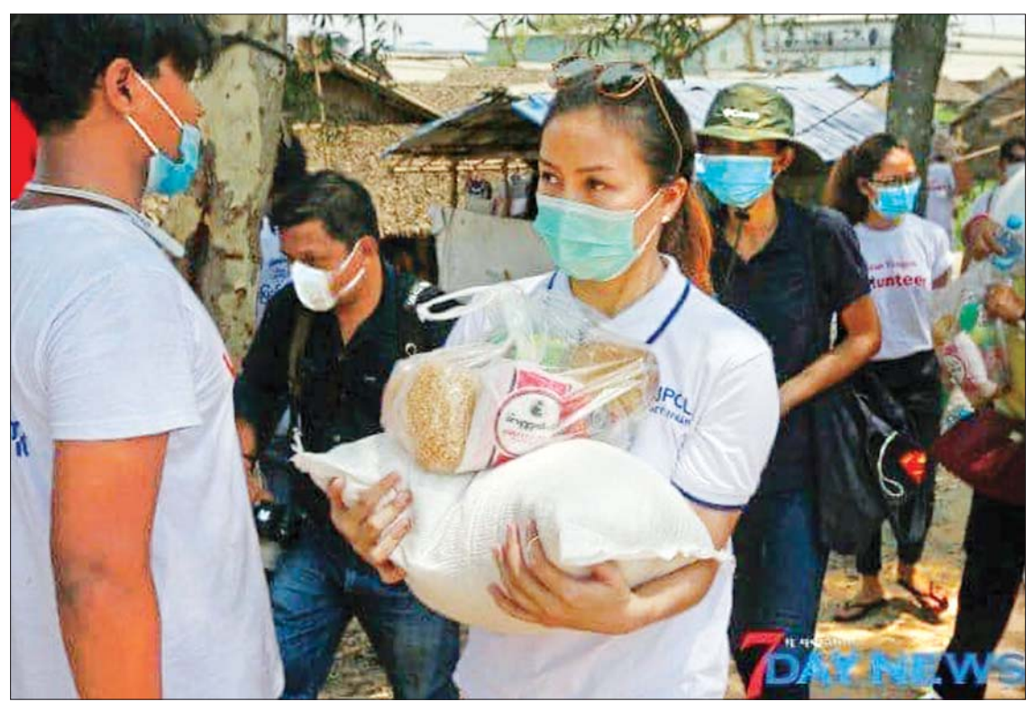
ကိုဗစ်-၁၉ ရောဂါ ခုခံကာကွယ်ချိန်တွင် ရန်ကုန်ပရဟိတလူငယ်များက ပြည်သူလူထုအား တတ်စွမ်းသမ္မု ပါဝင်ကူညီထောက်ပံ့ပေးစဉ်။

တွေ့ရပါသည်။ တိုင်းဒေသကြီးအတွင်းက မြို့နယ်အသီးသီးမှာ စိတ်တူပါသနာတူရာ စုပေါင်းဖွဲ့စည်းထားသည့် တစ်ပိုင်တစ်နိုင် ပရဟိတအသင်းများစွာမှာ ရန်ကုန်လူငယ်ထုရဲ့ လှုပ်ရှားဆောင်ရွက်မှုများကို တွေ့မြင်ကြရမှာဖြစ်ပါတယ်။ ရန်ကုန်လူငယ်ထု အများဆုံးပါဝင်သည့်ပရဟိတအသင်းများကို သန့်ရှင်းရေးကဏ္ဍ၊ ကျန်းမာရေးကဏ္ဍ၊ ကလေးသူငယ်စောင့်ရှောက်ရေးကဏ္ဍ၊ သက်ကြီးဘိုးဘွားစောင့်ရှောက်ရေးကဏ္ဍ၊ စားဝတ်နေရေးကဏ္ဍ စသည်ဖြင့် မိမိနစ်သက်ရာကဏ္ဍအလိုက် ဖွဲ့စည်းထားတတ်ကြပါသည်။ ရန်ကုန်လူငယ်ပရဟိတအဖွဲ့များအနေနဲ့ တိုင်းဒေသကြီးအတွင်း အရေးကိစ္စကြီးငယ် ပေါ်ပေါက်လာသည့်အခါတိုင်းမှာ ကားကို မီးရောင်စုံဖွင့်ပြီး အကူအညီပေးရန်အတွက် အပြေးအလွှားအရောက်လာတတ်ကြလေ့ရှိပါသည်။