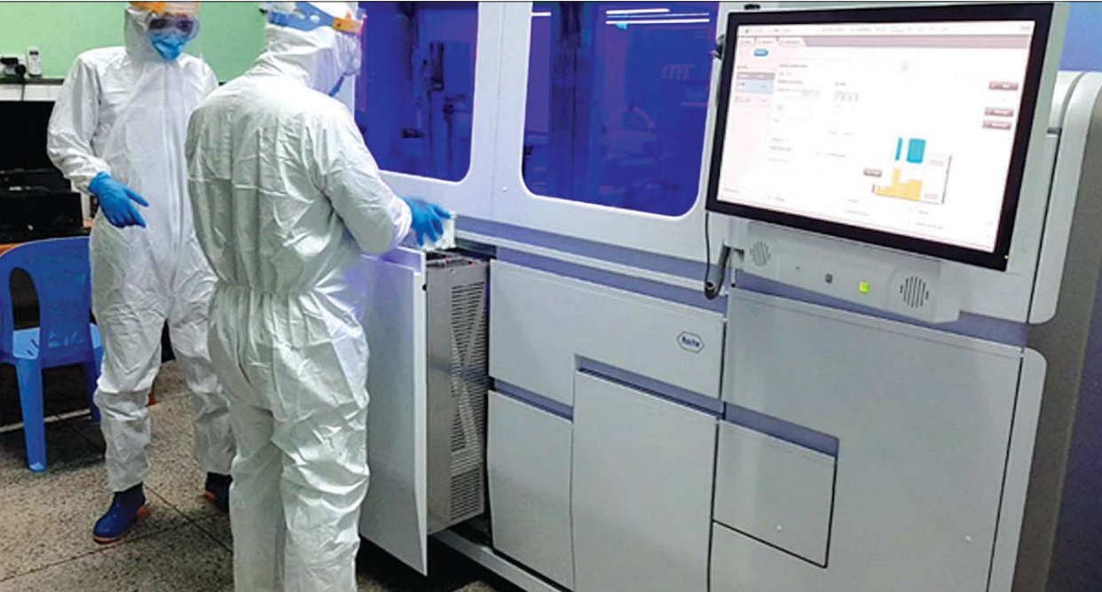
တပ်မတော်ရှိ COBAS 6800 စက်ကို တွေ့ရစဉ်။

COBAS 6800 စက်သည် Fully Automatic System ဖြစ်သည့်အတွက် တစ်ရက်လျှင် လူဦးရေ ၁၄၀၀ ခန့်ကို စမ်းသပ်စစ်ဆေးပေးနိုင်မည် ဖြစ်ပြီး စက်ကိုင်တွယ်သူများကို ရောဂါပိုးကူးစက်နိုင်မှု ရာခိုင်နှုန်းနည်းပါးပြီး အမြန်ဆုံး၊ အများဆုံးနှင့် အမှန်ကန်ဆုံး စစ်ဆေးပေးနိုင်မည်ဖြစ်ကြောင်း တပ်မတော်ကာကွယ်ရေးဦးစီးချုပ်ရုံး၏ ဧပြီ ၂၄ ရက် ထုတ်ပြန်ချက်အရ သိရသည်။