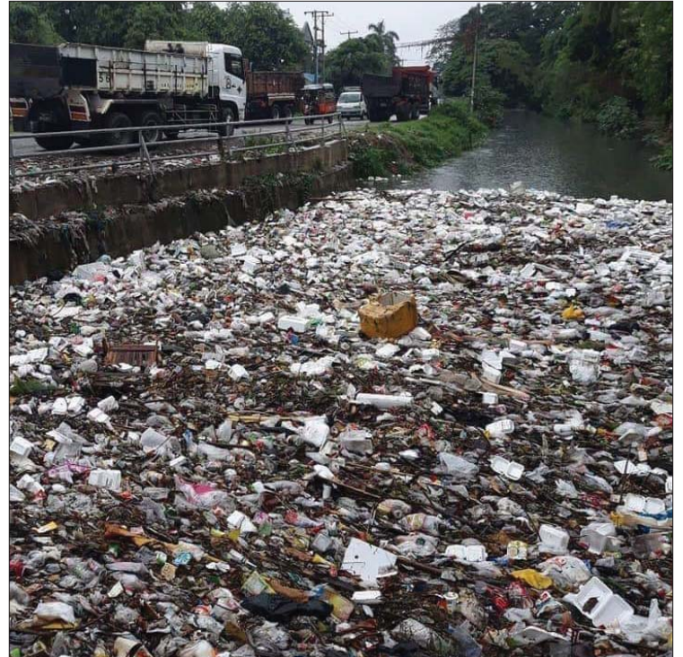
ချောင်းများအတွင်း စည်းကမ်းမဲ့စွန့်ပစ်ထားသည့် အမှိုက်မျိုးစုံ။

အရေးအကြီးဆုံးက အိမ်ရှေ့နဲ့နောက်ဖေး မြောင်းတွေ ရေစီးရေလာကောင်းနေဖို့ အဓိက အလိုအပ်ဆုံးပါပဲ။ ရန်ကုန်အိမ်တွေက အိမ်ရှေ့ မြောင်းတွေနဲ့ တစ်ဆက်တစ်စပ်တည်းရှိနေ တတ်သလို အိမ်နောက် တိုက်နောက် မြောင်း တွေက အမြဲရေစီးရေလာကောင်းဖို့ လိုအပ်ပါ တယ်။ ရေမြောင်းများလို့သာဆိုရပေမယ့် အချို့ ဆင်ခြေဖုံးရပ်ကွက်တွေမှာ အများအားဖြင့် ရေမြောင်းတွေတောင် မရှိတတ်ကြပါဘူး။ ရှိထားပြီးပြန်ရင်လည်း မြေတွေပြန်ပြည့်ပြီး