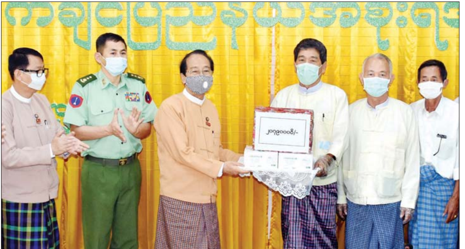
ပြည်နယ်ဝန်ကြီးချုပ် ဒေါက်တာခက်အောင်ထံ မြန်မာ-တရုတ် အမျိုးသားလူမှုကူညီရေးအဖွဲ့ကိုယ်စား ဦးအောင်မြင့် နှင့် အဖွဲ့ဝင်များက အလှူငွေနှင့် နှာခေါင်းစည်းများ ပေးအပ်လှူဒါန်းစဉ်။

ကချင်ပြည်နယ်အတွင်း ကိုဗစ်-၁၉ ရောဂါ ထိန်းချုပ်ကာကွယ်ကုသရေး အတွက် မြစ်ကြီးနားမြို့ မြန်မာ- တရုတ် အမျိုးသားလူမှုကူညီရေးအဖွဲ့ မှ အလှူငွေနှင့် နှာခေါင်းစည်းများ ပေးအပ်လှူဒါန်းမှုအတွက် ကချင် ပြည်နယ်ဝန်ကြီးချုပ် ဒေါက်တာ ခက်အောင်က ဂုဏ်ပြုမှတ်တမ်းလွှာ များကို ယနေ့ နံနက်ပိုင်းတွင် ပြည်နယ် အစိုးရအဖွဲ့ အစည်းအဝေးခန်းမ၌ ပေးအပ်သည်။