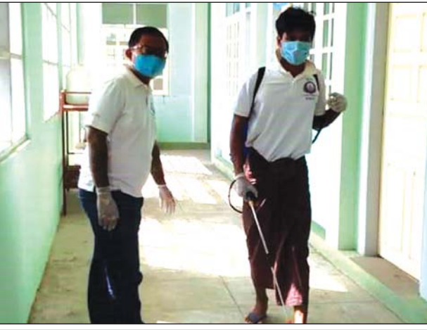
ညောင်ဦး အသွားအလာကန့်သတ်ထားသူများ ထားရှိမည့်နေရာ၌ ပိုးသတ်ဆေးဖျန်းစဉ်။

ညောင်ဦး မေ ၄ မန္တလေးတိုင်းဒေသကြီး ညောင်ဦးမြို့ရှိ မြတ်ဒါနုစေတနာရှင် ပရဟိတအဖွဲ့မှ ညောင်ဦးမြို့ ၂၅ ခုတင်ဆံ တိုင်းရင်းဆေးရုံ၌ ဖွင့်လှစ်ထားရှိသည့် ကိုဗစ်-၁၉ ကြိုတင်ကာကွယ်မှု အသွားအလာ ကန့်သတ်စောင့်ကြည့်ရေးစခန်း၌ ယနေ့တွင် စေတနာ့ဝန်ထမ်းများဖြင့် နေ့စဉ် ပါဝင်ကူညီစောင့်ရှောက်မှုပေးလျက်ရှိကြောင်း သိရသည်။