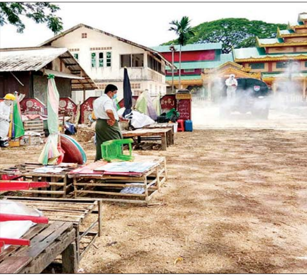
၂၈-၄-၂၀၂၀ ရက်က ထားဝယ်မြို့ တရုဇေးတွင် နယ်မြေခံတပ်မှ အရာရှိ၊ စစ်သည်များ၊ ထားဝယ်ခရိုင် မီးသတ်တပ်ဖွဲ့ဝင်များ ပူးပေါင်း၍ COVID-19 ကာကွယ်ဆေးဖျန်းစဉ်။