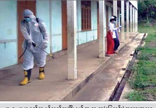
၂၈-၄-၂၀၂၀ ရက်က ပင်လည်ဘူးမြို့နယ် အ.ထ.က(မြေလင်း) အသွားအလာကန့်သတ်ထိန်းချုပ်စောင့်ကြပ်ကြည့်ရှုနေရာတွင် ပင်လည်ဘူးမြို့နယ် မီးသတ်တပ်ဖွဲ့ဝင်များနှင့် အဖွဲ့အစည်းများ ပူးပေါင်း၍ COVID-19 ကာကွယ်ဆေးဖျန်းစဉ်။