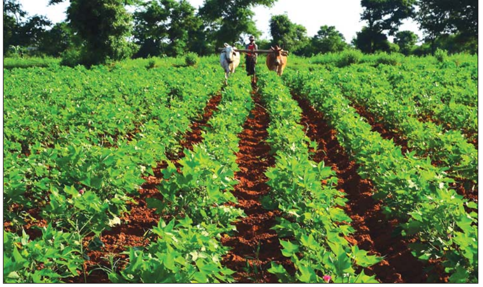
မိတ္ထီလာရှိ အောင်မြင်နေသော စိုက်ခင်းတစ်ခုကို တွေ့ရစဉ်