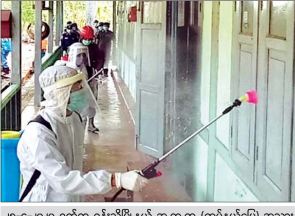
၂၈-၄-၂၀၂၀ ရက်က ဝန်းသိုမြို့နယ် အ.ထ.က (တပ်နယ်မြေ) အသွားအလာကန့်သတ်ထိန်းချုပ်စောင့်ကြပ်ကြည့်ရှုနေရာတွင် နယ်မြေခံတပ်မှ အရာရှိ၊ စစ်သည်များနှင့် ဝန်းသိုမြို့နယ် မီးသတ်တပ်ဖွဲ့ဝင်များ ပူးပေါင်း၍ COVID-19 ကာကွယ်ဆေးဖျန်းစဉ်။