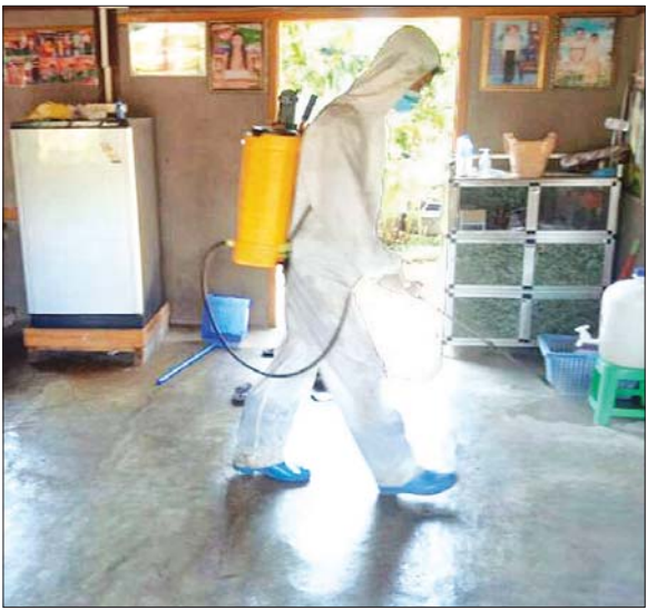
၂၈-၄-၂၀၂၀ ရက်က သာစည်မြို့နယ် သူဌေးကျေးရွာတွင် သာစည်မြို့နယ် မီးသတ်တပ်ဖွဲ့ဝင်များ COVID-19 ကာကွယ်ဆေးဖျန်းစဉ်။