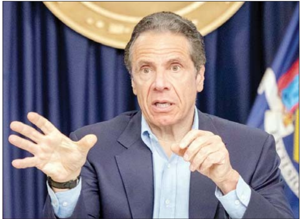
နယူးယောက်ပြည်နယ်အုပ်ချုပ်ရေးမှူး အန်ဒရူးကူအိုဆို

ဖြစ်ပွားလာနိုင်သည့် အခြေအနေကို ကြိုတင်ပြင်ဆင်သည့် အနေဖြင့် နယူးယောက်ပြည်နယ်နှင့် အခြား