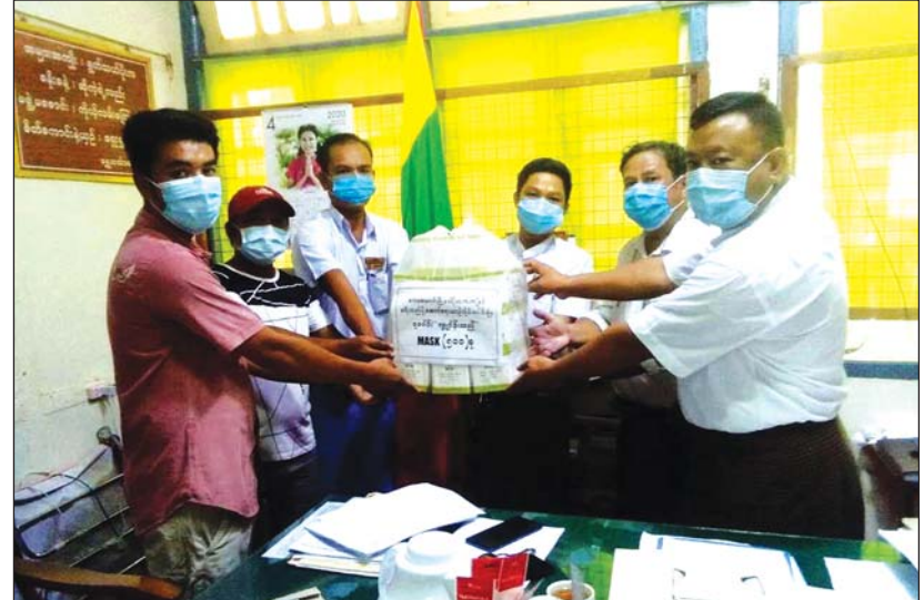
ကျေးသောင်း၌ ကိုဗစ်-၁၉ ကာကွယ်ရေး ငွေနှင့်နှာခေါင်းစည်းများ လှူဒါန်းစဉ်။