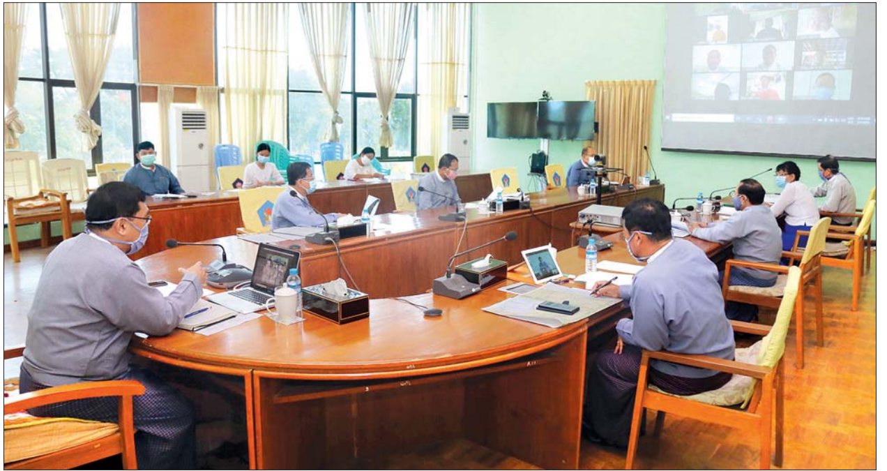
ချင်းပြည်နယ် ပလက်ဝမြို့နယ်အတွင်းရှိ တိုက်ပွဲရှောင်ပြည်သူများ၏ လက်ရှိအခြေအနေ၊ ဝန်ကြီးဌာနနှင့် ချင်းပြည်နယ်အစိုးရအဖွဲ့တို့၏ ဆောင်ရွက်နေမှု အခြေအနေနှင့် ဆက်လက်ပံ့ပိုးကူညီပေးနိုင်ရန် ကိစ္စရပ်များနှင့်စပ်လျဉ်း၍ ညှိနှိုင်းဆွေးနွေးပွဲ ကျင်းပစဉ်

ပြည်နယ်(၅)ခုရှိ တိုက်ပွဲရှောင်စခန်းများတွင် ကိုဗစ်-၁၉ ရောဂါအတွက် အသိပညာပေးလုပ်ငန်းများကို ထပ်မံထပ်ခါထပ်ခါ ထိရောက်စွာ ဆောင်ရွက်လျက်ရှိ ကြောင်း၊ စခန်းများအတွင်း နေထိုင်သူများအား အဝတ်ဖြင့်ချုပ်လုပ်ထားသော ပါးစပ်နှင့် နှာခေါင်းစည်းများ၊ ဆပ်ပြာများ ထောက်ပံ့ပေးလျက်ရှိကြောင်း၊ စခန်း အလိုက် အပူချိန်တိုင်း ကိရိယာများ၊ လက်ဆေးဘေစင်များကိုလည်း ထောက်ပံ့ ဆောင်ရွက်ပေးလျက်ရှိကြောင်း၊ ကိုဗစ်-၁၉ ရောဂါ အသိပညာပေးတွင် ကျန်းမာရေးနှင့် အားကစားဝန်ကြီးဌာနက တယ်လီဖုန်း Operator များမှ