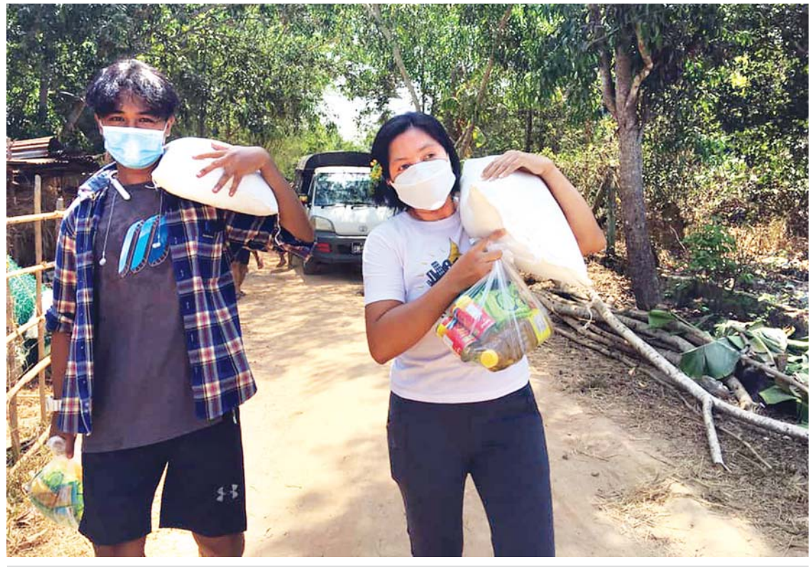
ရန်ကုန်မြို့ရှိ ပရဟိတလူငယ်များ ပြည်သူလူထုကို ကူညီထောက်ပံ့မည့် ဆန်အိတ်နှင့် စားသောက်ကုန်များ သယ်ယူလာစဉ်။

တွင် ပြည်သူလူထုကို ကျန်းမာရေးအသိပညာပေးမှုများ လုပ်ဆောင်ပေးလျက်ရှိသော Clean Yangon အဖွဲ့တွင် အမြဲတမ်းအသင်းဝင်ပေါင်း ၂၀၀ ကျော်နှင့် စေတနာ့ဝန်ထမ်းအသင်းဝင်ပေါင်း ၁၀၀၀ နီးပါး ပါဝင်လှုပ်အားပေးနေသည်။ ကိုဗစ်-၁၉ ကာလ အစိုးရနှင့် ပုဂ္ဂလိကအလှူရှင်များ လှူဒါန်းသော ဆန်အိတ်၊ ဆီပုံးကဲ့သို့ အလေးအပင်များ သယ်ယူရာတွင် လည်းကောင်း၊ မြို့နယ် ရပ်ကွက်များရှိ သာရေးနာရေးလူမှုကိစ္စ အဝဝတို့တွင် လည်းကောင်း ရန်ကုန်လူငယ်ထုက တတ်စွမ်းသမ္မုပိုင်းဝန်းကြသည်။ ထိုခိုက်အနာတရဖြစ်သူ၊ ကျန်းမာရေးမကောင်းသူ စသော အရေးပေါ်အခြေအနေဖြင့် ဆေးရုံဆေးခန်းရန် လိုသည့်အခါ ပရဟိတလူငယ်များက ပိုင်းဝန်းလုပ်ဆောင်ပေးတတ်ကြသည်။ ထို့ကြောင့်ပင် ယခုသီတင်းပတ်၏ ရန်ကုန်စာမျက်နှာထက်၌ ကိုဗစ်-၁၉ ကာလတွင် ပါဝင်လှုပ်ရှားလျက်ရှိသော ရန်ကုန်ပရဟိတလူငယ်များ လုပ်ဆောင်ခဲ့ပြီး ကိုဗစ်-၁၉ ရောဂါ ကာလ