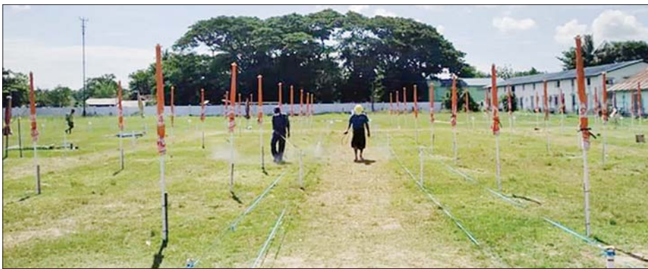
ယာယီပျံကျဈေး၌ ပိုးသတ်ဆေးဖျန်းခြင်း ဆောင်ရွက်စဉ်။

ပန်းတနော် မေ ၄ ရောဂါတိုင်းဒဏ်ကြီး ပန်းတနော် မြို့ အနောက်ပိုင်းရပ်ကွက် မြို့နယ် အားကစားကွင်းအတွင်း ယာယီပျံကျဈေးကို ဝတ်စုံ-၁၉ ကြိုတင်ကာကွယ်နိုင်ရန် အတွက် ပိုးမွှားအန္တရာယ်ကင်းရှင်းစေရန် ဆေးဖျန်းခြင်းလုပ်ငန်းများကို နေ့စဉ်ဆောင်ရွက်လျက်ရှိသည်။ အဆိုပါ ယာယီပျံကျဈေးတွင် ဟင်းသီးဟင်းရွက်၊ အသားငါး၊ စားသောက်ကုန်ပစ္စည်းများ ရောင်းချလျက်ရှိပြီး ဈေးဝယ်လာကြသော ပြည်သူများ ဈေးအတွင်းသို့မဝင်မီ နေ့စဉ်ဆေးခြင်း စည်းမျဉ်းတစ်စုံတစ်ရာကို လက်ဆေးကုန်များထားရှိပြီး လက်ဆေးစေခြင်းနှင့်