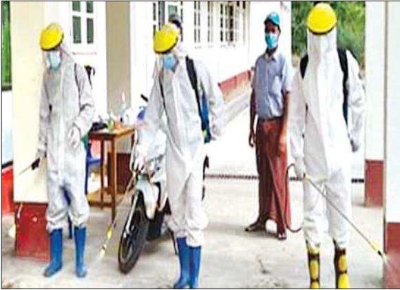
၂၈-၄-၂၀၂၀ ရက်က ရွှေဘိုမြို့ ရွှေဘိုတက္ကသိုလ် အသွားအလာကန့်သတ်ထိန်းချုပ်စောင့်ကြပ်ကြည့်ရှုနေရာတွင် ရွှေဘိုခရိုင်မီးသတ်စခန်းမှ မီးသတ်တပ်ဖွဲ့ဝင်များ COVID-19 ကာကွယ်ဆေးဖျန်းစဉ်။