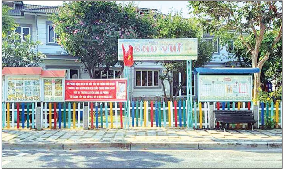
ဟိုချီမင်းမြို့ရှိ ကျောင်းတစ်ကျောင်းကို တွေ့ရစဉ်။

လွန်ခဲ့သည့်လအတွင်းက ဗီယက်နမ်နိုင်ငံသည် ခရီးသွားလာခွင့်နှင့် စီးပွားရေးလုပ်ငန်းများအားလုံးကို သုံးပတ်ကြာ ပိတ်ထားခဲ့သည်။ ပီတီအိုင်