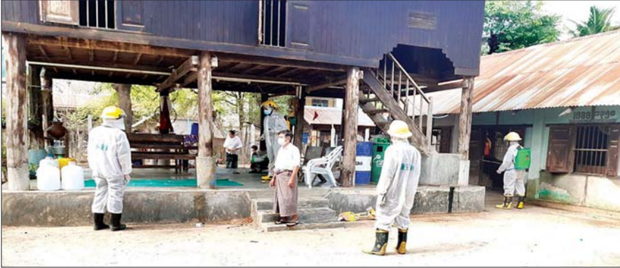
၂၈-၄-၂၀၂၀ ရက်က မတ္တရာမြို့နယ် ကျောက်တံတားကျေးရွာတွင် မတ္တရာမြို့နယ် မီးသတ်တပ်ဖွဲ့ဝင်များ COVID-19 ကာကွယ်ဆေးဖျန်းစဉ်။