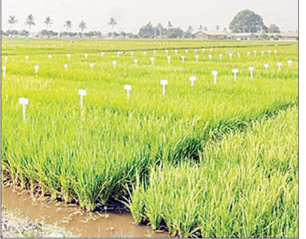
ဇင်ဓာတ်ကြွယ်ဝစေသည့် စပါးမျိုးများ ထုတ်လုပ်ပေးမည့် သုတေသနစိုက်ခင်း တစ်ခုကို တွေ့ရစဉ်။