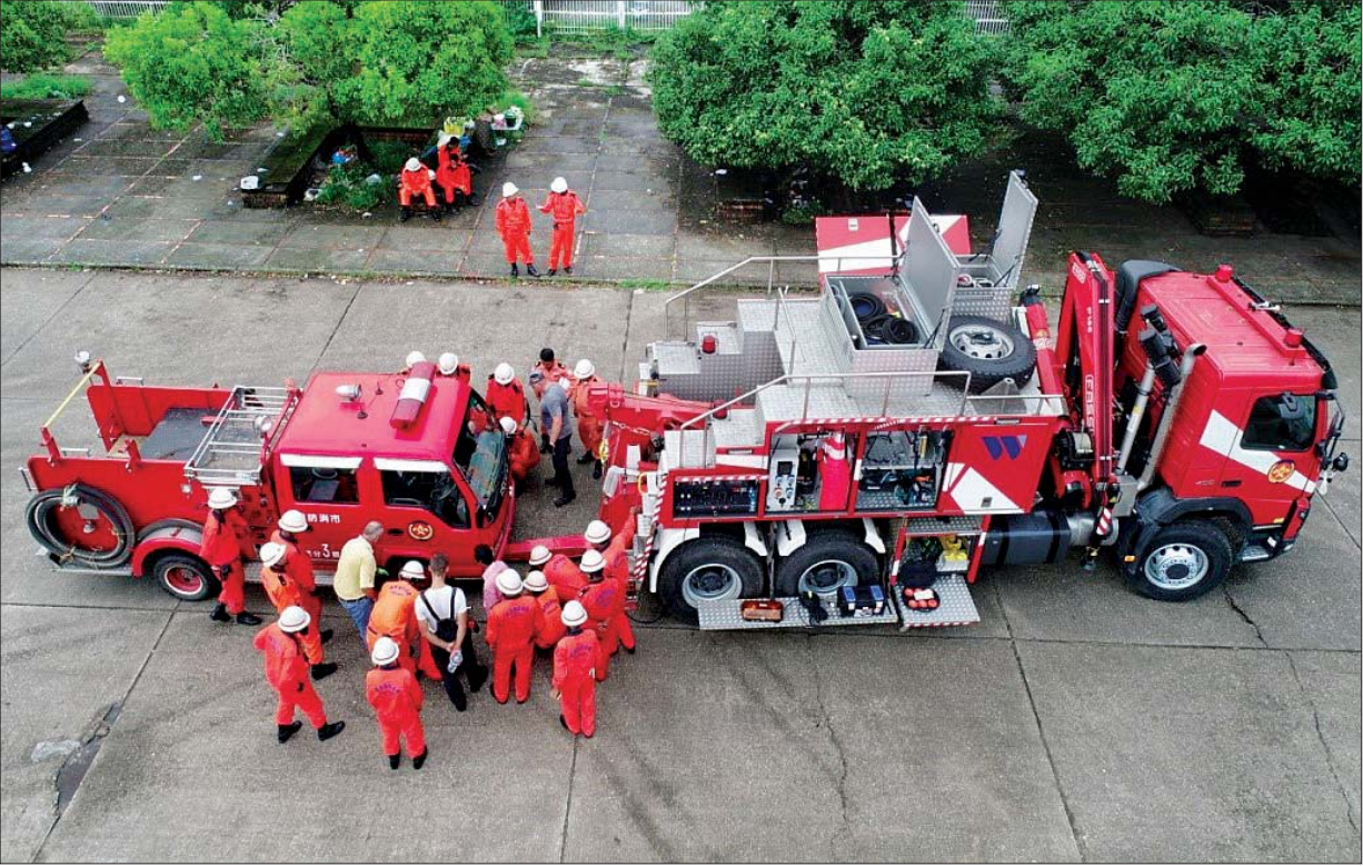
ပိုလန်နိုင်ငံ ODA အစီအစဉ်ဖြင့် ရရှိသည့် မီးငြှိမ်းသတ်ရေးနှင့် ရှာဖွေကယ်ဆယ်ရေးလုပ်ငန်းသုံးယာဉ်များ လက်တွေ့ကိုင်တွယ်ထိန်းသိမ်းနည်း သင်တန်းများ ဖွင့်လှစ်သင်ကြားပေးနေစဉ်။

မီးဘေးလုံခြုံရေး အသိပညာများ ပြည့်သူများအတွင်း စိမ့်ဝင်ပျံ့နှံ့စေရေးအတွက် မီးသတ်သုတေသနနှင့် မီးဘေးလုံခြုံရေးအသိပညာပေးရေးဌာနကို ၂၀၁၃ ခုနှစ် မေလ ၅ ရက်တွင် ရန်ကုန်တိုင်းဒေသကြီး စမ်းချောင်းမြို့နယ် ပြည်လမ်းတွင် ဖွင့်လှစ်ခဲ့သည်။ မီးသတ် သုတေသနနှင့် မီးဘေးလုံခြုံရေး အသိပညာပေးရေးဌာနတွင် ဟိုတယ်၊ မိုတယ်၊ တည်းခိုရပ်သာများ၊ ဈေးများ၊ စက်ရုံ/အလုပ်ရုံများနှင့် မီးဘေးအန္တရာယ် စိုးရိမ်ရသော လုပ်ငန်းများ၏ မီးဘေးလုံခြုံရေးလုပ်ငန်းများကို မီးသတ်ဦးစီးဌာနကိုယ်စား တာဝန်ယူဆောင်ရွက်နိုင်ရန် မီးဘေး လုံခြုံရေးလုပ်ငန်းများကို အရှိန်အဟုန်ဖြင့် ဆောင်ရွက်နိုင်ရန်နှင့် ပြည့်သူများအတွင်း မီးသတ်ပညာရပ်များ စိမ့်ဝင်ပျံ့နှံ့စေရန် မီးဘေးလုံခြုံရေးတာဝန်ခံ (Fire Safety Manager) သင်တန်းကို ၂၀၁၃ ခုနှစ်မှစတင်၍ သင်တန်းတစ်ကြိမ်လျှင် သင်တန်းသားဦးရေ ၅၀ ဖြင့် ဖွင့်လှစ်ခဲ့ရာ လက်ရှိ သင်တန်းအမှတ်စဉ် ၆၄ အထိ သင်တန်းသား ၃၁၄၄ ဦး မွေးထုတ်ပေးနိုင်ခဲ့သည်။