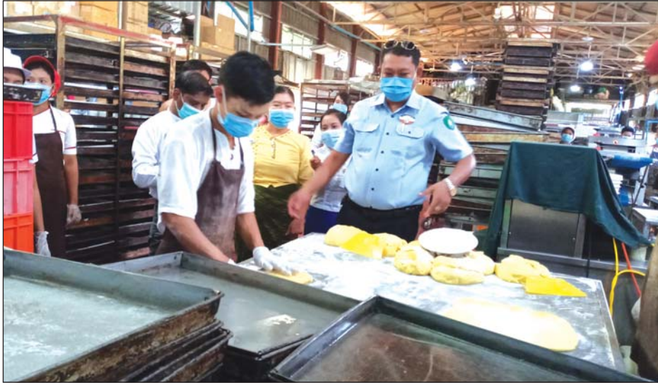
ကျောက်ရိတ်မြို့ရှိ စက်ရုံတစ်ရုံတွင် လုပ်ငန်းခွင်စစ်ဆေးစဉ်။

ကျောက်ရိတ် မေ ၄ ကျောက်ရိတ်မြို့ရှိ စက်ရုံအလုပ်ရုံ အလုပ်ဌာနများသည် ကိုဗစ်-၁၉ နှင့် ပတ်သက်၍ အလုပ်သမား၊ လူဝင်မှုကြီးကြပ်ရေးနှင့် ပြည်သူ့အင်အား ဝန်ကြီးဌာန၊ ကျန်းမာရေးနှင့် အားကစား ဝန်ကြီးဌာနမှ ထုတ်ပြန်ထားသည့် အသိပေးကြေညာချက်အပေါ် လိုက်နာ ဆောင်ရွက်ထားရှိမှု အခြေအနေအား သက်ဆိုင်ရာ အဖွဲ့အစည်းမှ ယမန်နေ့ နံနက် ၉ နာရီတွင် ကွင်းဆင်းဆောင်ရွက်ခဲ့သည်။