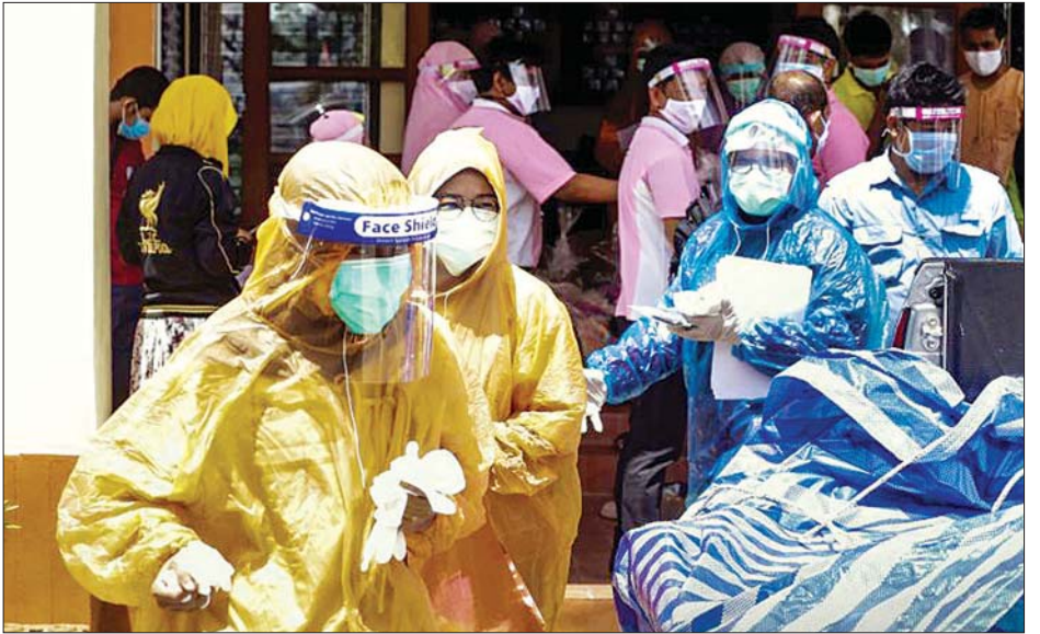
ထိုင်းနိုင်ငံတောင်ပိုင်း ယာလာပြည်နယ်ရှိ ဆေးရုံတစ်ရုံ၌ ကျန်းမာရေးဝန်ထမ်းများက ဒေသခံပြည်သူများကို ကျန်းမာရေးစစ်ဆေးမှု ဆောင်ရွက်ပေးစဉ်။