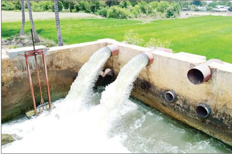
ရွှေတန့်တစ်မြစ်ရေတင်စီမံကိန်းမှ နွေစပါးစိုက်ခင်းများသို့ ရေပေးဝေထားစဉ်။

ပခုက္ကူမြို့နယ်တွင် ဆည်မြောင်းနှင့် ရေအသုံးချမှုစီမံခန့်ခွဲရေးဦးစီးဌာနမှ အကောင်အထည်ဖော်ဆောင်ရွက်သည့် ရွှေတန့်တစ်မြစ်ရေတင်စီမံကိန်းဖြင့် စိုက်ပျိုးသည့် နွေစပါးများ အောင်မြင်ဖြစ်ထွန်းလျက်ရှိသည်။