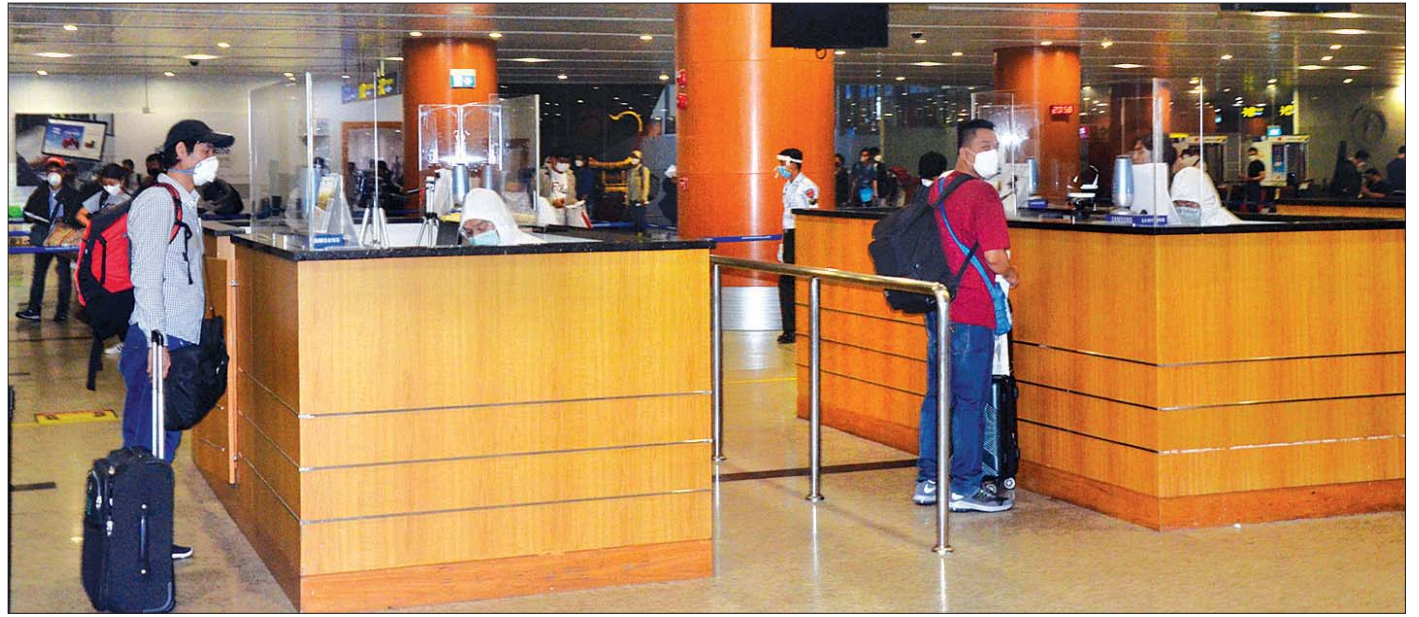
ဧပြီ ၃၀ ရက်က ကိုရီးယားနိုင်ငံမှ ရန်ကုန်အပြည်ပြည်ဆိုင်ရာလေဆိပ်သို့ ပထမအသုတ်အဖြစ် ပြန်လည်ရောက်ရှိလာသည့် မြန်မာနိုင်ငံသားများကို တွေ့ရစဉ်။

တိုင်ကြားပေးပို့လာသော မူးယစ်ဆေးဝါးသတင်းများနှင့် စပ်လျဉ်း၍ ထပ်မံဖော်ထုတ်ရရှိမှုများ ထုတ်ပြန်ခြင်း စာ ၆ COVID-19 ရောဂါ စောင့်ကြပ်ကြည့်ရှုမှုနှင့် ပတ်သက်၍ သတင်းထုတ်ပြန်ခြင်း (၄-၅-၂၀၂၀) ရက်နေ့၊ နံနက် (၈:၀၀)နာရီ စာ ၁၅