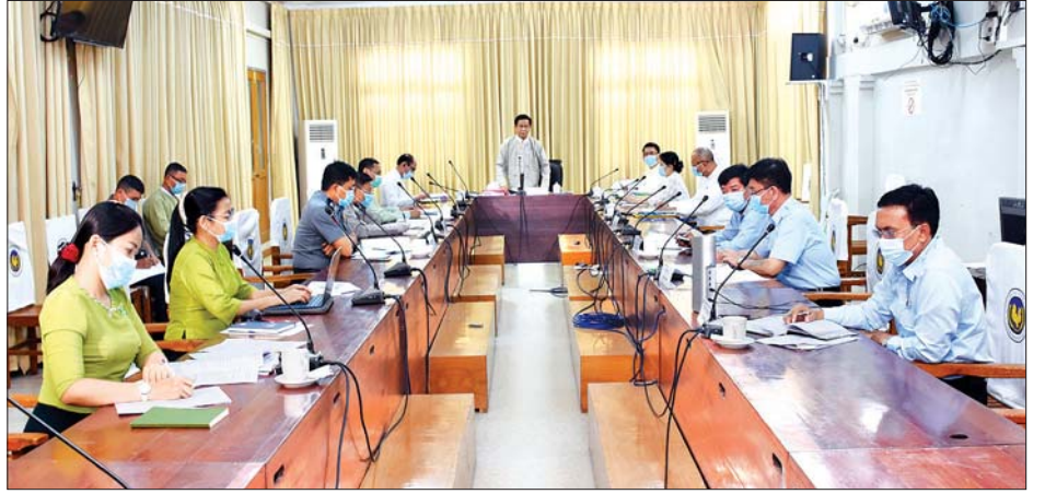
ဒုတိယဝန်ကြီး ဦးအောင်ထူး အရက်၊ ဘီယာ၊ ဝိုင်(ယမကာ) ထုတ်လုပ်၊ တင်သွင်း၊ ရောင်းချမှုဆိုင်ရာ ကြီးကြပ် ညှိနှိုင်းရေးကော်မတီ၏ ပဋိပက္ခအကြိမ် ညှိနှိုင်းအစည်းအဝေးတွင် အမှာစကားပြောကြားစဉ်။ သတင်းစဉ်

ညှိနှိုင်းဆွေးနွေးချက်များ၊ သဘောထားမှတ်ချက်များအပေါ် တွင် အခြေခံ၍ ပြင်ဆင်ဖြည့်စွက်မှုများကို သက်ဆိုင်ရာ လုပ်ငန်းစဉ်များနှင့်အညီ အမိန့်ကြော်ငြာစာ ထုတ်ပြန်နိုင် ရေး ဆောင်ရွက်သွားမည်ဖြစ်ကြောင်း၊ စတုတ္ထအကြိမ် ကော်မတီ အစည်းအဝေးဆုံးဖြတ်ချက်များအပေါ် သက်ဆိုင်ရာ ကဏ္ဍအလိုက် အကောင်အထည်ဖော် ဆောင်ရွက်ထားရှိမှု အခြေအနေများနှင့် ဆက်လက် ဆောင်ရွက်သွားမည့် ကိစ္စရပ်များအပေါ် အကြံပြုဆွေးနွေး ပေးကြရန်နှင့် ကော်မတီဝင်များအနေဖြင့် အကောက်ခွန် လွှတ်အရောင်းဆိုင်များ၊ အရက်ချက်စက်ရုံ၊ ယစ်မျိုးလိုင်စင် ခွင့်ပြုချက်ဖြင့် ယမကာရောင်းချသည့်ဆိုင်များကိုလည်း ကိုဗစ်-၁၉ ရောဂါကူးစက်မှုအခြေအနေ တည်ငြိမ်သွား သည့်အခါ ကွင်းဆင်းလေ့လာမှုများ ဆက်လက်ပြုလုပ် သွားမည်ဖြစ်ကြောင်း ပြောကြားသည်။