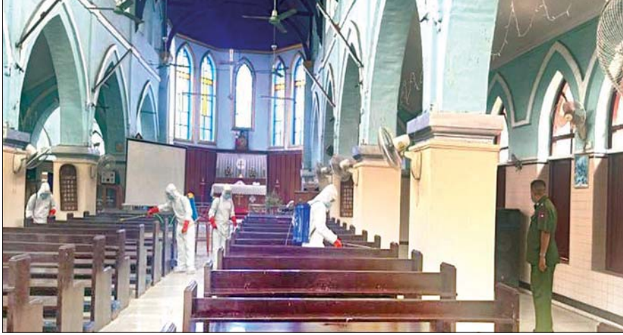
၂၈-၄-၂၀၂၀ ရက်က ချမ်းအေးသာစံမြို့နယ်ရှိ စရိမာရိယမာန် မယ်တော်ကြီးနှင့် သနန္တနဘုရားကျောင်းတို့တွင် အမှတ်(၂) စစ်ကြောရေးနှင့် တည်းခိုရေးစခန်း(နန်းတွင်း)မှ အရာရှိ၊ စစ်သည်များနှင့် ချမ်းအေးသာစံမြို့နယ် မီးသတ်တပ်ဖွဲ့ဝင်များ ပူးပေါင်း၍ COVID-19 ကာကွယ်ဆေးဖျန်းစဉ်။

သက်ဆိုင်ရာတိုင်းစစ်ဌာနချုပ်အသီးသီးမှ တပ်မတော်သားများ၊ မီးသတ်တပ်ဖွဲ့ဝင်များ၊ ဌာန၊ အဖွဲ့အစည်းများနှင့်ပူးပေါင်း၍ COVID-19 ရောဂါကာကွယ်ထိန်းချုပ်နိုင်ရေးအတွက် ပိုးသတ်ဆေးဖျန်းခြင်းလုပ်ငန်းများကို ဧပြီ ၂၈ ရက်က နေပြည်တော်၊ တိုင်းဒေသကြီး/ပြည်နယ်များမှ မြို့နယ် ၈၂ မြို့နယ်ရှိ နေရာ ၁၆၃ နေရာများတွင် မီးသတ်ယာဉ်များ၊ မီးသတ်ပစ္စည်းကိရိယာများဖြင့် ဆောင်ရွက်ခဲ့ရာ ပိုးသတ်ဆေးရည် ၁၂၀၂ ဒဿမ ၈ ဂါလန်၊ ရေ ၇၂၁၆၈ ဂါလန် သုံးစွဲခဲ့ပြီး ပိုးသတ်ဆေးဖျန်းခြင်းလုပ်ငန်းများကို တာဝန်ရှိသူများက လိုက်လံကြည့်ရှုအားပေးခဲ့ကြောင်း သိရှိရသည်။ သတင်းစဉ်