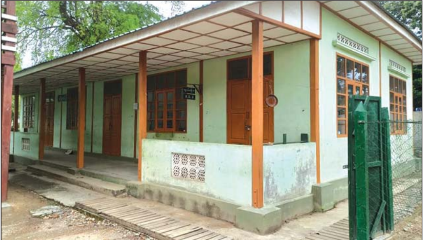
ဂန့်ဂေါ်၌ အသွားအလာကန့်သတ်ထားရှိသူများအတွက် အဆောက်အအုံကို တွေ့ရစဉ်။

အသွားအလာ ကန့်သတ်ထားရှိနိုင်ရေးနှင့် ပြင်ဆင်ထားရှိခြင်း နေရာလေးနေရာ သတ်မှတ် စောင့်ကြည့်နေရာ ချထားရေးအတွက် ကြိုတင် ထားရှိကြောင်းသိရသည်။ ထင်အောင်နိုင်(ဂန့်ဂေါ်)