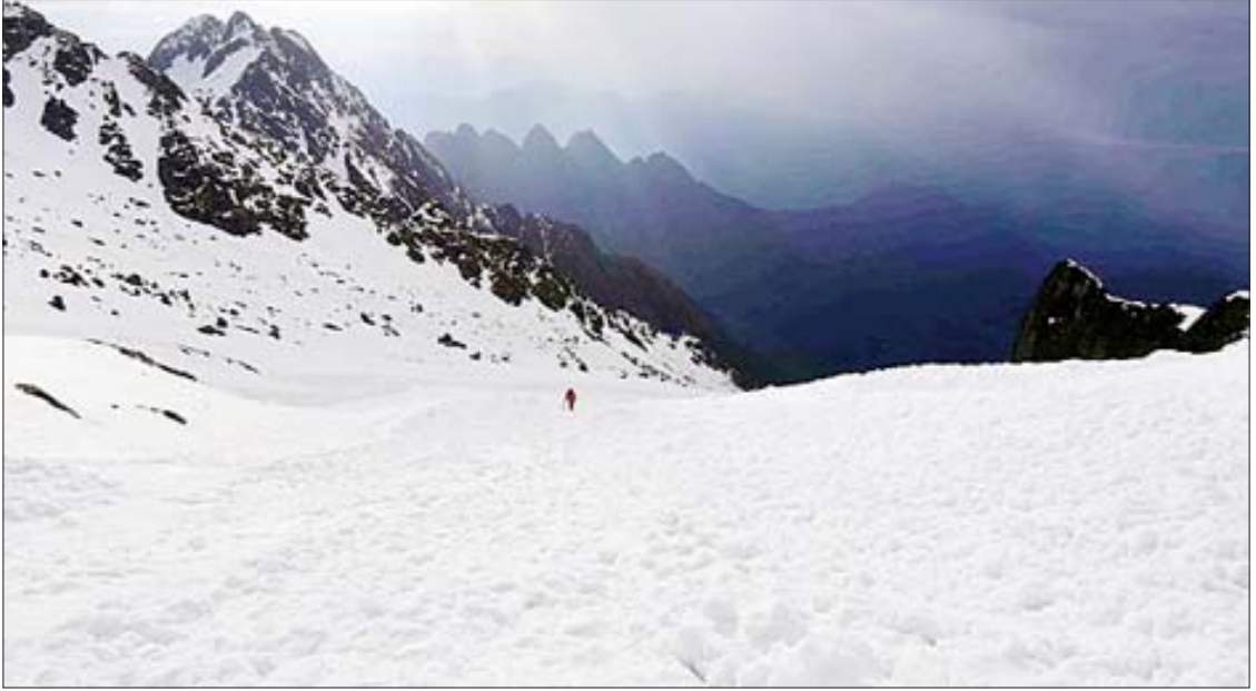
ကချင်ပြည်နယ် ပူတာအိုဒေသရှိ ရေခဲတောင်များကို တွေ့ရစဉ်။

Facebook, Twitter, Instagram, Pinterest, YouTube နဲ့ LinkedIn စတဲ့ Social Media Channel တွေမှာ မြန်မာနိုင်ငံ ခရီးစဉ်ဒေသတွေနဲ့ ဆွဲဆောင်မှုတွေအကြောင်းကို အင်္ဂလိပ်ဘာသာနဲ့ နေ့စဉ်လွှင့်တင်ဖော်ပြပေးနေပါတယ်။ ၂၀၁၉ ခုနှစ် ဧပြီလကနေ အချုပ်ပိုင် (က) သို့