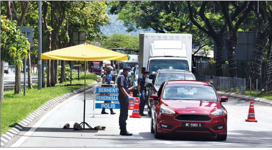
မလေးရှား၌ ယာဉ်မောင်းသူများအား အပူချိန်စစ်ဆေးမှုဆောင်ရွက်နေစဉ်။

ကာလာလမ်ပူ ဗြူစွန်တွင် ဈေးဆိုင်အချို့၌ ဝန်ထမ်းများက ဝယ်ယူမှုများကို ဆိုင်ထဲသို့မဝင်ရောက်မီ အပူချိန်တိုင်းတာ စစ်ဆေးမှုများ ဆောင်ရွက်ပေးခဲ့သည်။ ဆင်ပွား