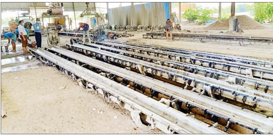
ပန်းတနော်မြို့နယ်ရှိ စက်ရုံအလုပ်ရုံများအား တာဝန်ရှိသူများ စစ်ဆေးကြစဉ်။

ပန်းတနော် မေ ၄ ကိုဗစ်-၁၉ ရောဂါ ကူးစက်ပြန့်ပွားမှု မရှိစေရေး ကြိုတင်ကာကွယ်ရေးအတွက် ဧရာဝတီတိုင်းဒေသကြီး ပန်းတနော်မြို့နယ်အတွင်းရှိ လုပ်သား ၅၀၀ အောက်ရှိသော စက်ရုံ၊ အလုပ်ရုံများကို မေ ၁ ရက်မှစတင်၍ သက်ဆိုင်ရာ တာဝန်ရှိသူများက လိုက်လံစစ်ဆေးလျက်ရှိသည်။ ကိုဗစ်-၁၉ ရောဂါကူးစက်ပြန့်ပွားမှု မရှိစေရေး ကြိုတင်ကာကွယ် ထိန်းချုပ်ရေးလုပ်ငန်းများ ဆောင်ရွက်လျက်ရှိရာ ခရိုင်အလုပ်သမား ညွှန်ကြားရေးဦးစီးဌာန၊ ခရိုင်အလုပ်ရုံနှင့် အလုပ်သမားစစ်ဆေးရေးဦးစီးဌာန၊ မြို့နယ်အထွေထွေအုပ်ချုပ်ရေးဦးစီးဌာန၊ မြို့နယ်ကျန်းမာရေးဦးစီးဌာန၊ မြို့နယ်စည်ပင်သာယာရေးအဖွဲ့၊ ငါးလုပ်ငန်းဦးစီးဌာနနှင့် လူမှုဖူလုံရေးအဖွဲ့တို့ပူးပေါင်း၍ ပန်းတနော်မြို့နယ် ဆက်သေကျေးရွာရှိ သဘာဝမြေဩဇာစက်ရုံ၊ ပသွယ်ကျေးရွာရှိ ဟီးရီး