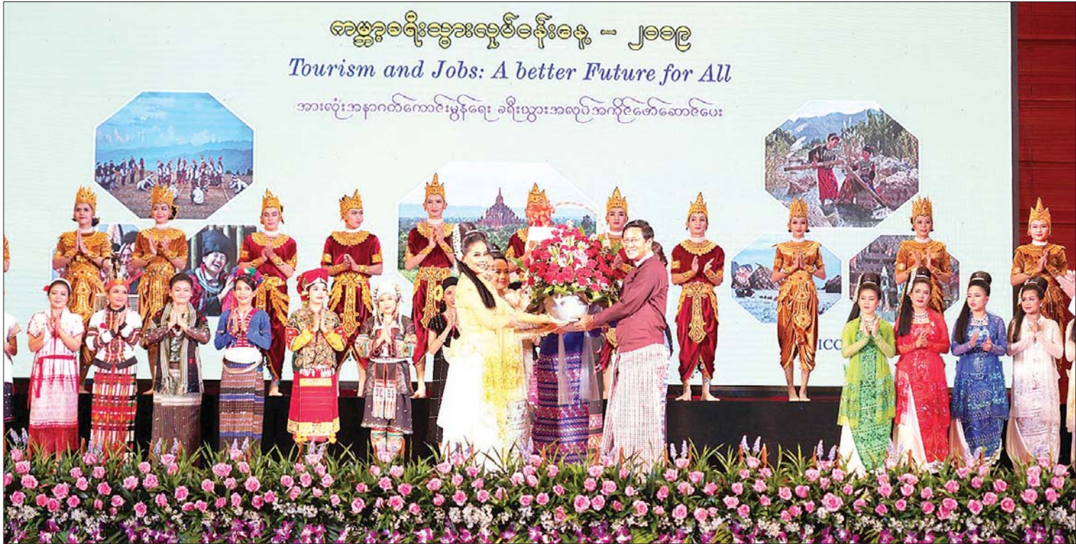
ဒုတိယသမ္မတ ဦးဟင်နရီဗန်ထီးယူ ၂၆-၉-၂၀၁၉ ရက်က ကျင်းပသည့် ကမ္ဘာ့ခရီးသွားလုပ်ငန်းနေ့-၂၀၁၉ အခမ်းအနားတွင် ဖျော်ဖြေသည့် အနုပညာရှင်များအား ဂုဏ်ပြုပန်းခြင်းပေးအပ်စဉ်။