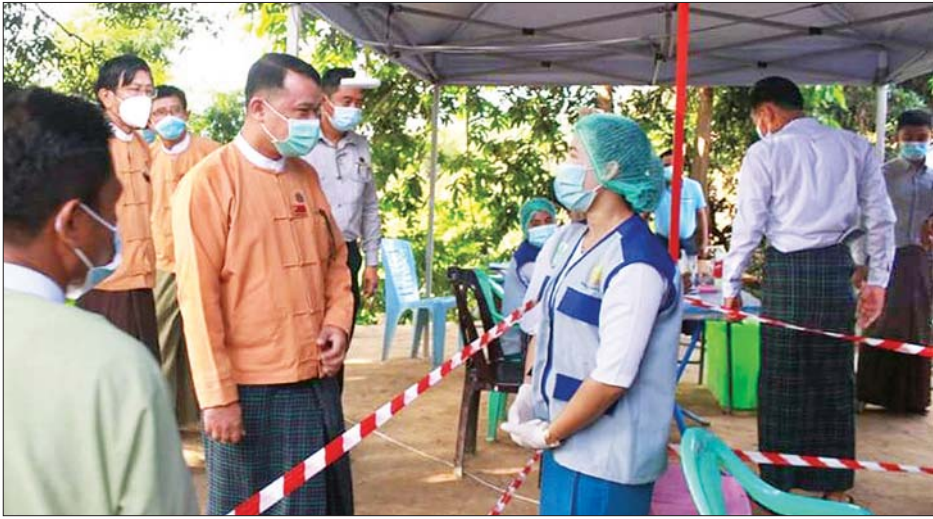
တိုင်းဒေသကြီးဝန်ကြီးချုပ် ဦးမြင့်မောင် ကလိန်အောင်မြို့ မလွဲတောင်စစ်ဆေးရေးဂိတ်၌ ကိုဗစ် - ၁၉ ရောဂါ ကာကွယ်၊ ထိန်းချုပ်ရေး လုပ်ငန်းဆောင်ရွက်နေမှုများအား ကြည့်ရှုစစ်ဆေးစဉ်။