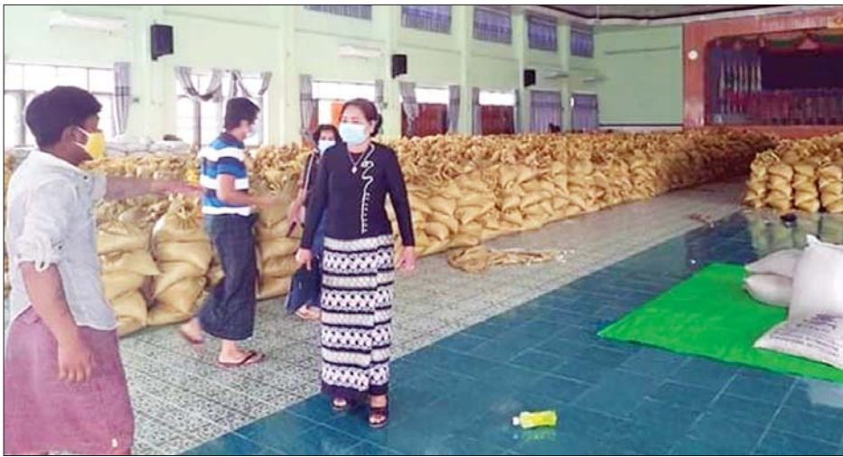
အရပ်ဘက်အဖွဲ့အစည်းများ၊ လူမှုရေးအသင်းအဖွဲ့များနှင့် စေတနာရှင်များက ပူးပေါင်းဆောင်ရွက်လျက်ရှိသည်။ ဧပြီ ၁၀ ရက်က ကိုဗစ်-၁၉ ရောဂါ ကာကွယ် ထိန်းချုပ် ကုသရေး ဗဟိုကော်မတီ၏ စီစဉ်မှုဖြင့် သင်္ကြန် ရုံးပိတ်ရက်ရှည်ကာလအတွင်း ကလေးမြို့နယ်အတွင်းရှိ ပုံမှန်ဝင်ငွေမရှိသော အခြေခံလူတန်းစား အိမ်ထောင်စု

ကလေး မေ ၃ စစ်ကိုင်းတိုင်းဒေသကြီး ကလေးခရိုင် ကိုဗစ်-၁၉ ရောဂါ ကာကွယ် ထိန်းချုပ် ကုသရေးကော်မတီက ဦးဆောင်၍ ကလေးမြို့ မြို့မမြို့နယ်နှင့် စေတနာရှင်ပြည်သူများ စုပေါင်း လှူဒါန်းထားသော ရိက္ခာစားသောက်ကုန်ပစ္စည်းများအား ကလေးမြို့နယ်အတွင်းရှိ ပုံမှန်ဝင်ငွေမရှိသော အခြေခံ လူတန်းစား အိမ်ထောင်စုပေါင်း ၇၅၀၀ ကျော်ကို ကူညီ ထောက်ပံ့နိုင်ရေး ပြင်ဆင်ဆောင်ရွက်လျက်ရှိကြောင်း သိရသည်။ (ယာပုံ)