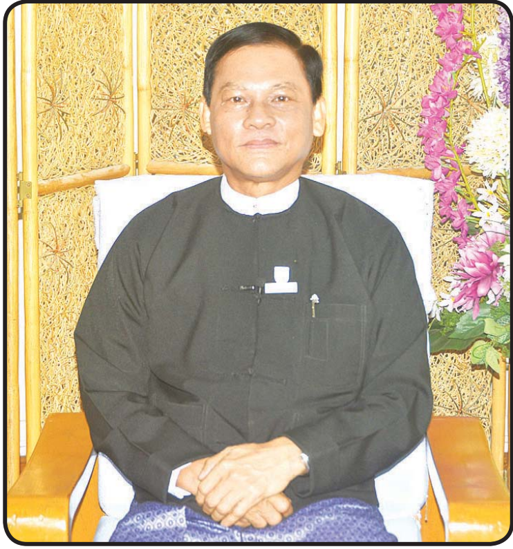
ပြည်ထောင်စုရှေ့နေချုပ် ဦးထွန်းထွန်းဦး