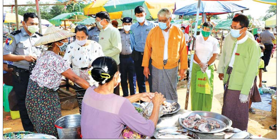
ရွှေတိုခရိုင်/မြို့နယ်အဆင့်တာဝန်ရှိသူ များနှင့်အတူ ယနေ့နံနက်ပိုင်းက စစ်ကိုင်းတိုင်းဒေသကြီး ကျောက်

ကော်မတီ ဥက္ကဋ္ဌ တိုင်းဒေသကြီး ဝန်ကြီးချုပ် ဒေါက်တာ မြင့်နိုင်နှင့် ဇနီး ဒေါ်တင့်တင့်(ခ) ဒေါ်ချူးချူးသည်