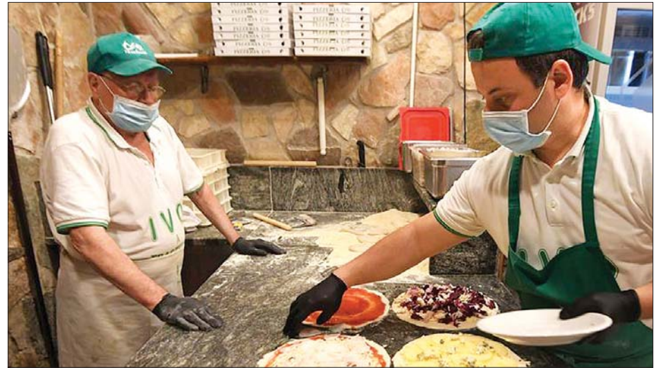
ရောမမြို့ရှိ ပီစာဆိုင်တစ်ဆိုင်ကို တွေ့ရစဉ်။

ကူးစက်ခံရသူ လူနာအသစ် ၁၉၀၀ တိုးလာခဲ့ပြီး ဧပြီ ၁ ရက်နှင့် နှိုင်းယှဉ် လျှင် ကူးစက်ခံရမှုနှုန်း ကျဆင်းလာ ကြောင်းတွေ့ရသည်။ အီတလီတွင် ရောဂါကူးစက်ခံရပြီးနောက် နောက်