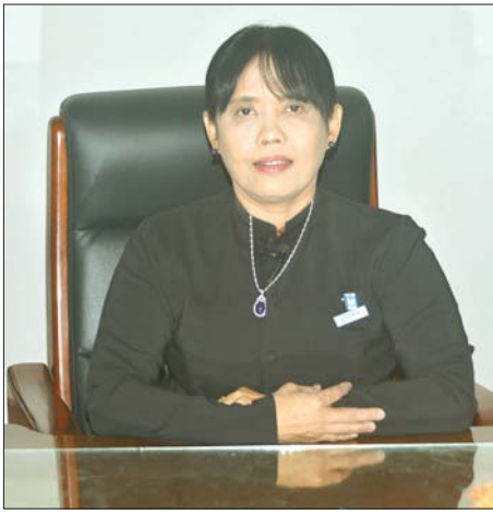
အမြဲတမ်းအတွင်းဝန် ဒေါက်တာသီတာဦး