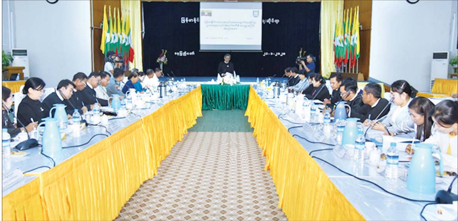
ဒုတိယရှေ့နေချုပ် ဦးဝင်းမြင့် မြန်မာနိုင်ငံ ကလေးအလုပ်သမား ပပျောက်ရေးဆိုင်ရာ ဥပဒေရေးရာလုပ်ငန်းကော်မတီအစည်းအဝေးတွင် အမှာစကားပြောကြားစဉ်။

အတွင်း ဆောင်ရွက်မှုများကို ပြန်သုံးသပ်ပြီး ပိုမိုကောင်းမွန်သည့် ဥပဒေဝန်ဆောင်မှုများ ပေးနိုင်ရန် ဒုတိယ ၅ နှစ်စီမံကိန်း (၂၀၂၀ - ၂၀၂၄) ကို ချမှတ်အကောင်အထည်ဖော် ဆောင်ရွက်သွားမည်ဖြစ်သည်။ တရားလွှတ်တော် ရှေ့နေများကောင်စီ သည် တရားလွှတ်တော်ရှေ့နေအဖြစ် ဝင်ခွင့်လျှောက်ထားသူများကို စိစစ်ကာ ပြည်ထောင်စု တရားလွှတ်တော်ချုပ်သို့ သဘောထားပေးပို့ခြင်းနှင့် တရားလွှတ်တော် ရှေ့နေများ၏ ကျင့်ဝတ်သိက္ခာဖောက်ဖျက်မှု များနှင့်ပတ်သက်၍ အရေးယူဆောင်ရွက်ရန် သင့်/မသင့် ပြည်ထောင်စုတရားလွှတ်တော်ချုပ် သို့ သဘောထားပေးပို့ခြင်းများကို အဓိကထား ဆောင်ရွက်လျက်ရှိသည်။ တရားလွှတ်တော် ရှေ့နေများကောင်စီ နှင့်စပ်လျဉ်း၍ ပြည်ထောင်စုရှေ့နေချုပ် ဦးထွန်းထွန်းဦးက “၂၀၁၉ ခုနှစ် ဇွန်လမှာ တရားလွှတ်တော် ရှေ့နေများကောင်စီ အက်ဥပဒေကို ပြင်ဆင်တဲ့ ဥပဒေပြဋ္ဌာန်းခဲ့ ပါတယ်။ ဥပဒေသစ်အရ အဖွဲ့ဝင် ၁၅ ဦးအနက် ရွေးကောက်တင်မြှောက်ခံရတဲ့ တရား လွှတ်တော်ရှေ့နေ ၁၁ ဦး ပါဝင်မှာ ဖြစ်ပါ တယ်။ ပြည်ထောင်စုတရားလွှတ်တော်ချုပ်က ရွေးကောက်တင်မြှောက်ရမယ့် နည်းလမ်းနဲ့ နည်းဥပဒေရေးဆွဲပြီး လွှတ်တော်ကို ပေးပို့ တင်ပြထားပါတယ်။ လွှတ်တော်က ယခုနှစ်