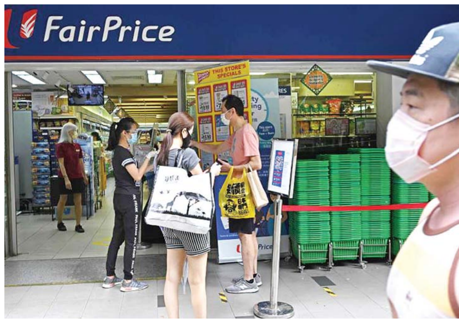
စင်ကာပူရှိ ဈေးဝယ်ကုန်တိုက်တစ်ခုရှေ့၌ နှာခေါင်းစည်း တပ်ဆင်ထားသည့် ဈေးဝယ်သူများအားတွေ့ရစဉ်။

ခဲ့သည်။ သို့ရာတွင် လုပ်ငန်းခွင်ပြန်လည် ဝင်ရောက်မည့် အလုပ်သမားများအတွင်း ရောဂါကူးစက်ပျံ့နှံ့မှုကို ကာကွယ် တားဆီးနိုင်ရေးအတွက် ကျန်းမာရေးဆိုင်ရာ တိုင်းတာစစ်ဆေးမှုများ အဆက်မပြတ် လုပ်ဆောင်ရန် လိုအပ်ကြောင်း ၎င်းက ပြောကြားခဲ့သည်။ လုပ်ငန်းခွင်အချို့နှင့် ဝန်ဆောင်မှုလုပ်ငန်းများကို လာမည့် မေ ၁၂ ရက်မှစတင်ကာ လုပ်ငန်းပြန်လည်ပတ်မည်ဖြစ်ပြီး အဆိုပါရက်သတ္တပတ်၌ သတ်မှတ်ထားသည့် စာသင်ကျောင်းများမှ ကျောင်းသားအချို့ ကျောင်းပြန်လည်တက်ရောက်ခွင့် ရရှိမည်ဖြစ်ကြောင်း အာဏာပိုင်များက ယမန်နေ့တွင် ပြောကြားခဲ့သည်။ စင်ကာပူနိုင်ငံအတွင်း ဧပြီလအစောပိုင်းမှစတင်ကာ စာသင်ကျောင်းများနှင့် လုပ်ငန်းခွင်အများစုကို ပိတ်သိမ်းရန် အပါအဝင် ကပ်ရောဂါထိန်းချုပ်ရေး လမ်းညွှန်ချက်များ ချမှတ်လိုက်ပြီးနောက်