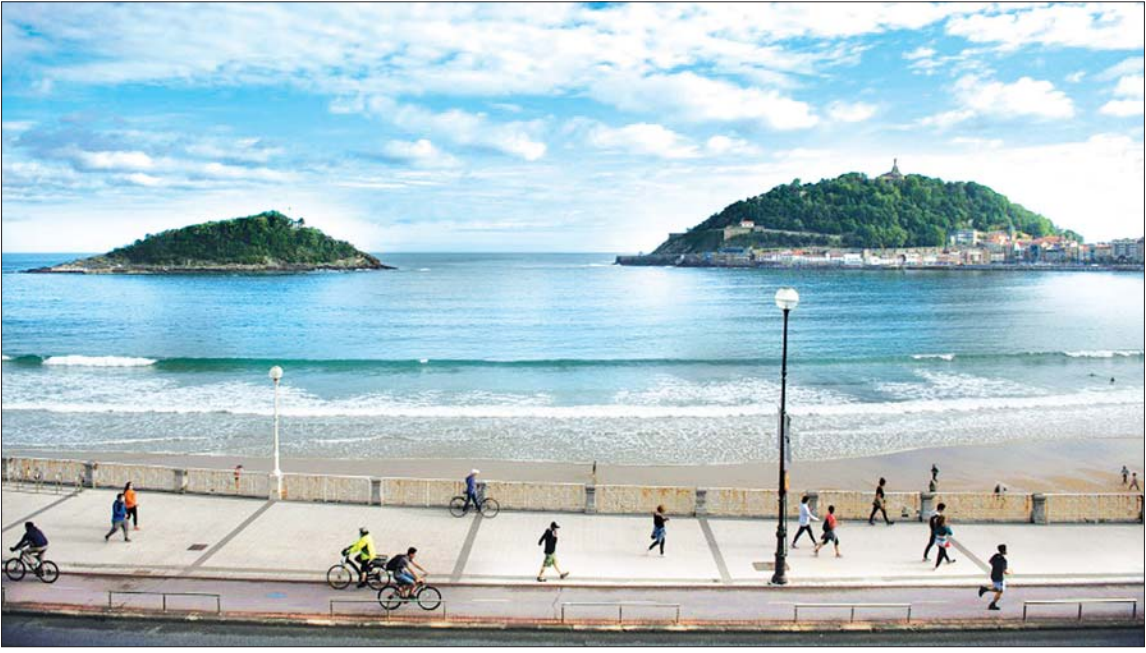
စပိန်နိုင်ငံတွင် ကန့်သတ်မှုဖြေလျှော့ပေးလိုက်သည့် ပထမသီတင်းပတ်အတွင်း သွားလာလှုပ်ရှားသူများကို တွေ့ရစဉ်။

စပိန်နိုင်ငံသားတွေကတော့ ၄၈ ရက်ကြာ အသွားအလာ ကန့်သတ်ခံရပြီးတဲ့နောက် ပထမဆုံးအကြိမ်အဖြစ် လမ်းထွက်ပြီးတော့ စက်ဘီးစီးတာတွေ၊ လမ်းလျှောက်တာတွေ၊ အားကစားလုပ်တာတွေ၊ စက်တီးတာတွေ ပြန်လုပ်လာကြပါပြီ။ သတိကြီးစွာဖြေလျှော့ ဥရောပနိုင်ငံအချို့မှာတော့ ကိုဗစ် -၁၉ ဗိုင်းရပ်စ်ကြောင့် ပိတ်ဆို့ကန့်သတ်ထားမှုတွေ ကို တဖြည်းဖြည်းချင်း သတိကြီးစွာ ဖြေလျှော့ ပေးနေပါပြီ။ ရုရှားနိုင်ငံမှာတော့ ဗိုင်းရပ်စ် ကူးစက်ခံရမှုနှုန်းဟာ မြင့်တက်နေဆဲပါ။ အခုဆိုရင် တစ်ကမ္ဘာလုံးက အစိုးရတွေဟာ ကန့်သတ်မှုတွေကို ဘယ်လိုမျိုးဖြေလျှော့ပြီး စီးပွားရေးလုပ်ငန်းတွေကို ဘယ်လိုပြန်စတင် မလဲဆိုတာနဲ့ ပတ်သက်ပြီး ဖိအားတွေနဲ့ ကြုံတွေ့နေရပါတယ်။ အမေရိကန်အာဏာပိုင် ကတော့ ကိုဗစ် -၁၉ လူနာတွေကို ကုသဖို့ အတွက် အရေးပေါ်အခြေအနေမှာ အသုံးပြုဖို့ ဆေးဝါးကို တရားဝင် ခွင့်ပြုပေးခဲ့ပါတယ်။