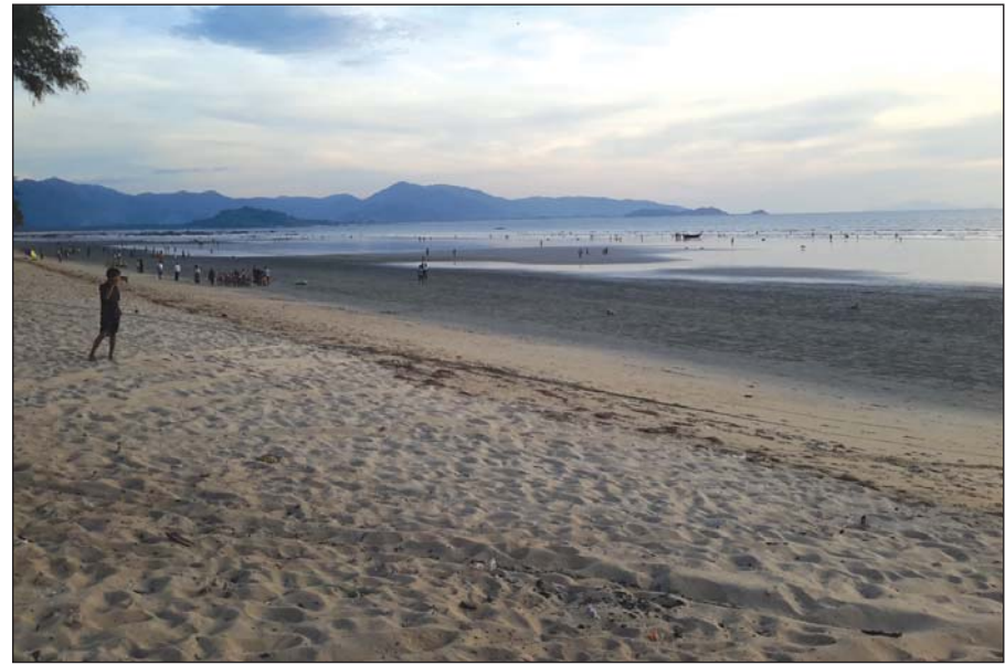
လောင်းလုံးမြို့နယ်မှ မောင်းမကန်ကမ်းခြေ၏ သဘာဝရှုခင်းအလှ

သရက်ချောင်းမြို့သည် ထားဝယ်မြို့မှ တောင်ဘက် သို့ ၂၉ ကီလိုမီတာ ကွာဝေး၍ ထားဝယ်ရေဝင်များအရ သက္ကရာဇ် ၁၀၀၀ ပြည့်နှစ်တွင် ရှက်ချောင်းအမည်ဖြင့် တည်ထောင်ခဲ့သည်ဟု ဆိုသည်။ ကာလကြာမြင့်လာချိန် တွင် ရှက်ချောင်းမှ သရက်ချောင်း ဖြစ်လာခဲ့ကာ ၁၈၇၂ ဧပြီလ ၇ ရက်တွင် သရက်ချောင်းကို မြို့အဖြစ်သတ်မှတ်၍ ယင်းနှစ် ဒီဇင်ဘာ ၃၀ ရက်တွင် သရက်ချောင်းမြို့နယ် အတွင်းမှ ကျေးရွာအုပ်စုများကို ဖွဲ့စည်းခဲ့သည်။