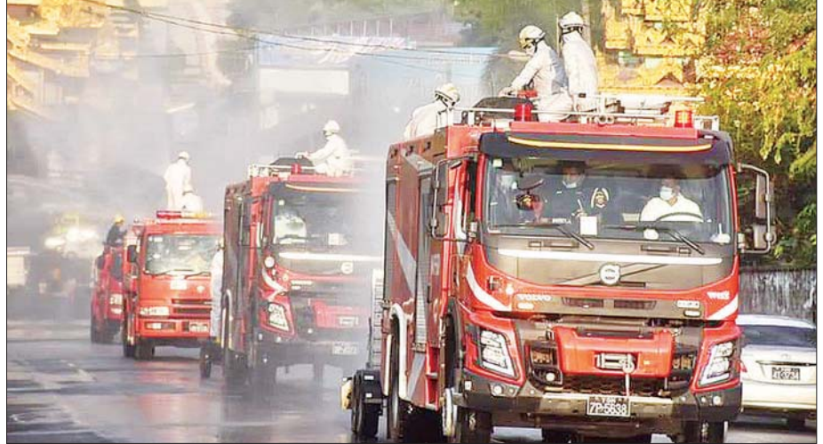
ကိုဗစ်-၁၉ ရောဂါ ကာကွယ် ထိန်းချုပ်ရေးအတွက် ပိုးသတ်ဆေးဖျန်းမှုတွင် မီးသတ်တပ်ဖွဲ့ဝင်များ ပါဝင်ဆောင်ရွက်စဉ်။

နိုင်ငံတစ်ဝန်း သဘာဝဘေးအန္တရာယ် များဖြစ်သည့် ရေဘေး၊ လေဘေး၊ ငလျင်ဘေးနှင့် ရုတ်တရက်ဖြစ်ပွား စေတတ်သည့် ဘေးအန္တရာယ်များ ဖြစ်ပွားမှုမှာ ၂၀၁၅ ခုနှစ်မှ ၂၀၁၉ ခုနှစ်အထိ ငါးနှစ်တာအတွင်း မွန်ပြည်နယ် ပေါင်မြို့နယ်ရှိ မလတ် တောင်ပြိုမှုအပါအဝင် ရှာဖွေ ကယ်ဆယ်ရေးလုပ်ငန်းများ စုစုပေါင်း ၈၅၉ ကြိမ် ဆောင်ရွက်ခဲ့ရပြီး သေဆုံးသူ ၃၀၅၂ ဦးနှင့် ဒဏ်ရာ ရရှိသူ ၁၁၈၈၉ ဦးရှိခဲ့ရာ ရှာဖွေ ကယ်ဆယ်ရေးလုပ်ငန်းများကို ဒေသ အလိုက် သန္ဓေ အရန်မီးသတ်တပ်ဖွဲ့ ဝင်များမှ သက်ဆိုင်ရာ မိတ်ဖက် အဖွဲ့အစည်းများနှင့်အတူ ပူးပေါင်း ဆောင်ရွက်ခဲ့ကြပါသည်။