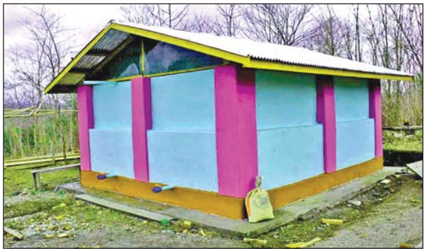
တည်ဆောက်ပြီးစီးနေသည့် ဂါလန် ၆၇၀၀ ဆံ့ ရေစုကန်