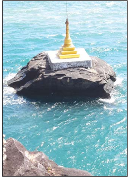
မောင်းမကန်ကမ်းခြေ ပင်လယ်အတွင်းမှ စေတီတစ်ဆူ

တစ်ချိန်က ရေလမ်းခရီးနှင့် လေကြောင်းခရီးဖြင့်သာ သွားလာနိုင်ခဲ့သည့် တနင်္သာရီကမ်းမြောင်ဒေသသို့ ယခုအခါတွင် ကုန်းလမ်းခရီးဖြင့် ကော့သောင်းမြို့အထိ သွားလာနိုင်ကာ ရထားဖြင့် ထားဝယ်မြို့အထိ သွားလာနိုင်ကြပြေသည်။