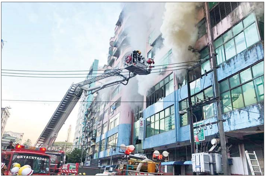
၂၀-၂-၂၀၂၀ ရက်က ရန်ကုန်မြို့ လမ်းမတော် သံဈေးမီးလောင်မှုကို အထပ်မြင့် မီးငြိမ်းသတ်ရေးယာဉ် အသုံးပြု၍ မီးသတ်တပ်ဖွဲ့ဝင်များ ငြိမ်းသတ်နေစဉ်။

၁၉၆၃ ခုနှစ်၊ တော်လှန်ရေးကောင်စီအစိုးရလက်ထက် တွင် ပြည်ထဲရေးဝန်ကြီးဌာန၏ အမိန့်အမှတ် ၅၅ အရ ၁၉၆၃ ခုနှစ် မီးသတ်တပ်ဖွဲ့ဥပဒေကို အသစ်ထုတ်ပြန် ပြဋ္ဌာန်း၍ မီးသတ်တပ်ဖွဲ့ကို အခြားသောလက်နက်ကိုင်