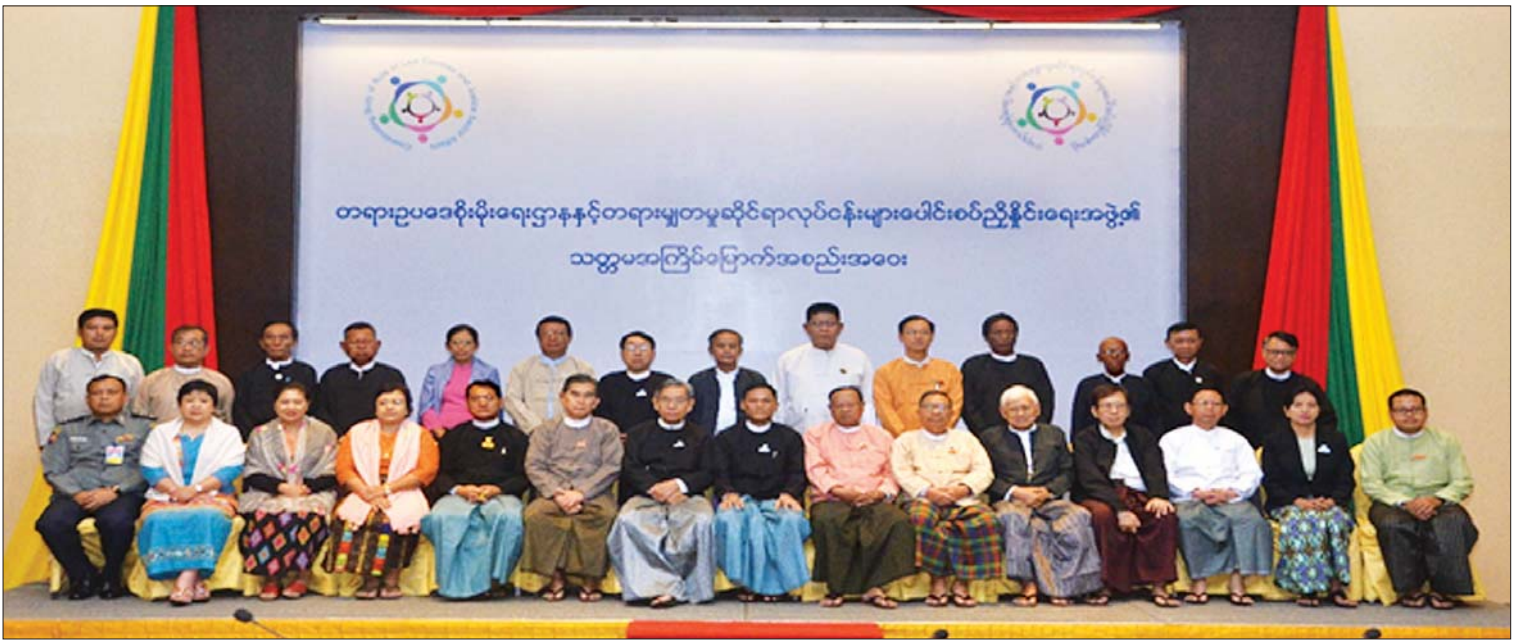
တရားဥပဒေစိုးမိုးရေးဌာနနှင့် တရားမျှတမှုဆိုင်ရာလုပ်ငန်းများ ပေါင်းစပ်ညှိနှိုင်းရေးအဖွဲ့၏ သတ္တမအကြိမ် အစည်းအဝေးသို့ တက်ရောက်ကြသည့် ပြည်ထောင်စုအဆင့် အဖွဲ့ဝင်များ၊ တိုင်းဒေသကြီး/ပြည်နယ် အဖွဲ့ခေါင်းဆောင်များနှင့် စုပေါင်းမှတ်တမ်းတင်ဓာတ်ပုံရိုက်စဉ်။

“ဥပဒေအကြံဉာဏ်ပေးရေးဦးစီးဌာနမှာ ဌာနခွဲ ၃ ခုရှိပြီး ဌာနအနေနဲ့ အစိုးရဌာန၊ အဖွဲ့အစည်းတွေထံ အပြည်ပြည်ဆိုင်ရာ