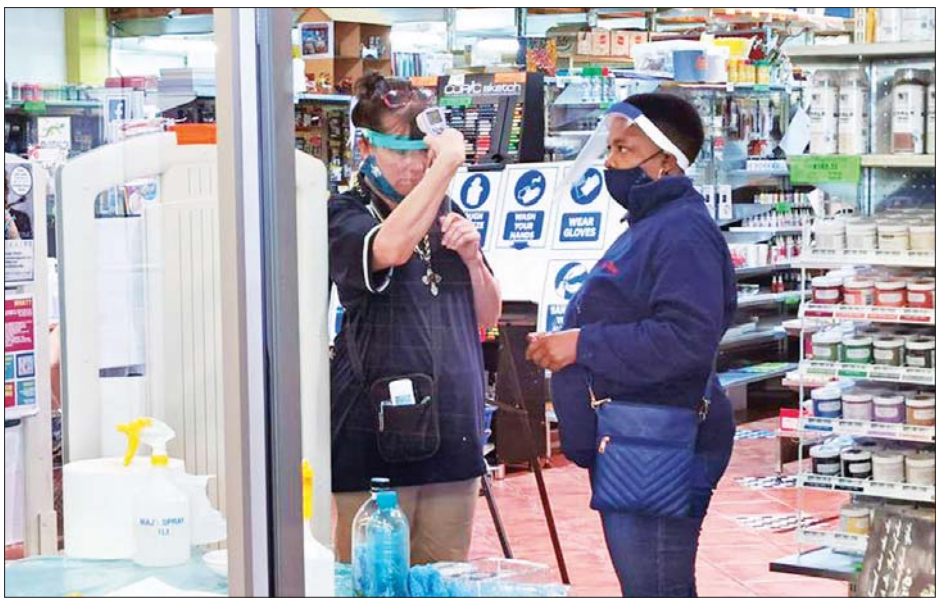
ဂျီဟန်နက်စ်ဘတ်မြို့တွင် ဆိုင်မဖွင့်မီ ဝန်ထမ်းများ အပူချိန်တိုင်းနေစဉ်။

ကိုဗစ် -၁၉ ရောဂါနှင့် ဆက်စပ်ပြီး သေဆုံးသူပေါင်း မှာ မေ ၂ ရက်အထိ ၁၂၃ ဦး သေဆုံးခဲ့ပြီးဖြစ်သည်။ တောင်အာဖရိကတွင် ကိုဗစ် -၁၉ နှင့် ဆက်စပ်ပြီး အများ ဆုံးသေဆုံးရသည့် အသက်အရွယ်မှာ ၆၄ နှစ် ဖြစ်ကြောင်း နာတာရှည် ရောဂါခံစားနေသူများမှာ သေဆုံးမှုများ ကြောင်း သွေးတိုးရောဂါ၊ ဆီးချိုရောဂါ၊ နှလုံးရောဂါအခံ ရှိသူများ သေဆုံးမှုများကြောင်း ကျန်းမာရေးဝန်ကြီးက ပြောကြားခဲ့သည်။ အသက် ၆၃ နှစ်နှင့်အထက် လူကြီးများနှင့် သွေးတိုး၊ နှလုံး၊ ဆီးချိုရောဂါအခံရှိသူများ အနေဖြင့် ပိုမိုသတိထား ကြိုတင်ကာကွယ်ထားရန်လည်း ၎င်းက တိုက်တွန်းခဲ့သည်။ တောင်အာဖရိကနိုင်ငံသားများအနေဖြင့် တတ်နိုင်သမျှ အိမ်တွင်း၌သာ နေကြရန်လည်း တိုက်တွန်းပြောကြား ခဲ့ကြောင်း သိရသည်။