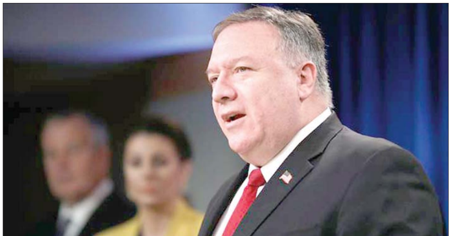
အမေရိကန်နိုင်ငံခြားရေးဝန်ကြီး မိုက်ပွန်ပီအို။

တွန်းလှန်မည့်အန္တရာယ်မှ ရှောင်ရှားရန် အရေးယူပိတ်ဆို့မှုများကို လက်နက်ကုန်သွယ် အသုံးချလေ့ရှိကြောင်း ရှိခါနီက ပြောကြားခဲ့သည်။ ထို့အပြင် ၎င်းက အမေရိကန်၏ ဖိအားပေးမှုကို ရင်ဆိုင်ရာတွင် ဥရောပမိတ်ဖက်အဖွဲ့အစည်းများ အနေဖြင့် မိမိတာဝန်ကို ကျေပွန်စွာ ဆောင်ရွက်ကြရန်နှင့် လူသားဆန်မှုကို အားပေးထောက်ခံကြရန် တိုက်တွန်းခဲ့သည်။ အမေရိကန် နိုင်ငံခြားရေးဝန်ကြီး မိုက်ပွန်ပီအိုက အမေရိကန်အနေဖြင့် အီရန်၏ လက်နက်ရောင်းချမှုအပေါ် ကုလသမဂ္ဂလုံခြုံရေးကောင်စီ၏ ပိတ်ပင်မှုကို အချိန်ထပ်တိုးရေး လုပ်ဆောင်နိုင်မည့် အရာမှန်သမျှကို ထည့်သွင်း စဉ်းစားမည်ဖြစ်ကြောင်း ပြောကြားခဲ့သည်။ အီရန်အစိုးရက အီရန်အပေါ် လက်နက်ကုန်သွယ်မှု ပိတ်ပင်ထားသည့်အချိန်ထပ်တိုးခဲ့လျှင် ပြင်းပြင်းထန်ထန် တုံ့ပြန်မည်ဖြစ်ကြောင်း ပြောကြားခဲ့သည်။ ဆင်ဟွာ