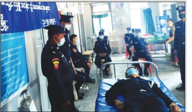
(၇၄)နှစ်မြောက် မြန်မာနိုင်ငံ မီးသတ်တပ်ဖွဲ့နေ့ကို ကြိုဆိုရုတ်ပြုသောအားဖြင့် ရမည်းသင်းခရိုင် မီးသတ်ဦးစီးဌာနမှ သန္ဓေမီးသတ်တပ်ဖွဲ့ဝင်နှင့် အရန်မီးသတ် တပ်ဖွဲ့ဝင်များ စုပေါင်း၍ ရမည်းသင်းခရိုင် ပြည်သူ့ဆေးရုံကြီး၌ မေ ၃ ရက်က သွေးလှူဒါန်းစဉ်။ မင်းမင်းလတ်(ရူပဗေဒ)