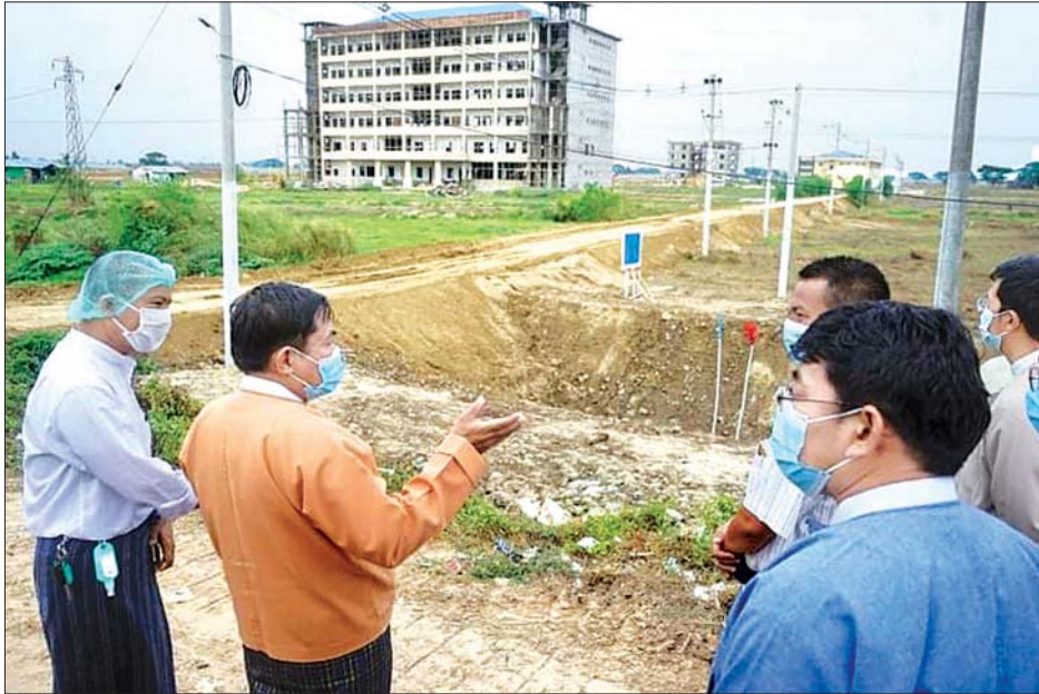
ရှင်းလင်းတင်ပြခဲ့ကြသည်။ ထို့နောက် ဝန်ကြီးချုပ်က Isolation Unit (ကလီ)တွင် ကိုဗစ်-၁၉ လူနာများ မီးဖွားရန်နှင့် ခွဲစိတ်ကုသရန် အရေး ပေါ် သားဖွားခန်းနှင့် ခွဲစိတ်ခန်းပြင်ဆင်ဆောင်ရွက်နေမှု

ပဲခူးတိုင်းဒေသကြီးဝန်ကြီးချုပ် ဦးဝင်းသိန်းသည် ယနေ့ နံနက်ပိုင်းက ဌာနဆိုင်ရာတာဝန်ရှိသူများနှင့်အတူ ပဲခူးမြို့ ကလီ (၆) ထပ်ဆေးရုံအနီးတွင် ဖွင့်လှစ်ထားရှိသော COVID-19 Designated Hospital ဖြစ်သည့် ပဲခူး ပြည်သူ့ဆေးရုံကြီး၏ COVID-19 PUI လူနာများထားရှိ ကုသပေး လျက်ရှိသော Isolation Unit (ကလီ)သို့ သွားရောက် ကြည့်ရှုသည်။