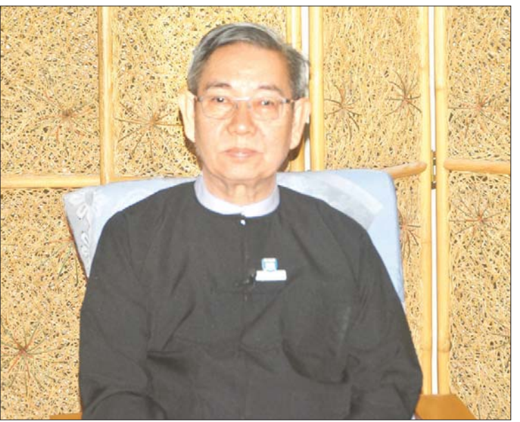
ဒုတိယရှေ့နေချုပ် ဦးဝင်းမြင့်

ဝန်ကြီးများ၊ ဒုတိယစစ်ဥပဒေချုပ်၊ ညွှန်ကြားရေးမှူးချုပ်များနှင့် ဒုတိယရဲချုပ်တို့ ပါဝင်သည်။ ပထမအကြိမ် အစည်းအဝေးကို ၁၄-၂-၂၀၂၀ ရက်တွင် ကျင်းပခဲ့ပြီး ဆောင်ရွက်မည့် လုပ်ငန်းအစီအစဉ်များကို ဆွေးနွေးခဲ့ကြောင်း သိရသည်။ “အစီရင်ခံစာအရ တိုက်ခိုက်မှုဖြစ်စဉ် အတွင်း ရာဇဝတ်မှုတွေကို ARSA အကြမ်းဖက် အဖွဲ့ဝင်တွေနဲ့ ၎င်းတို့ရဲ့ အလိုတူ ပူးပေါင်း ပါဝင်ခဲ့သူတွေ၊ လုံခြုံရေးတပ်ဖွဲ့တွေနဲ့ အရပ်သားတွေက ကျူးလွန်ခဲ့ကြောင်း၊ ဒီကျူးလွန်မှုတွေဟာ နေရာဒေသ ၁၃ ခုမှာ အဓိက ဖြစ်ပွားခဲ့တယ်လို့ တွေ့ရှိရပါတယ်။ ဒီဖြစ်စဉ် ၁၃ ခု ဖြစ်ပွားခဲ့တဲ့ ရာဇဝတ်မှုတွေ အနက် ရဲတပ်ဖွဲ့က အမှုဖွင့်လှစ် အရေးယူ ဆောင်ရွက်ဆဲအမှုတွေ ရှိပါတယ်။ အမှုဖွင့်လှစ် အရေးယူဆောင်ရွက်ထားခြင်း မရှိသေးတဲ့ အမှုတွေ ရှိပါတယ်။ ဒီအမှုတွေကို အသေးစိတ် စိစစ်ပြီး ဆက်လက်စုံစမ်းဖော်ထုတ် အရေးယူ ဆောင်ရွက်သွားမှာ ဖြစ်ပါတယ်။ ရခိုင်ပြည်နယ် ဖြစ်စဉ်အတွင်း လူ့အခွင့်အရေးဆိုင်ရာ ချိုးဖောက်မှုတွေအပေါ် နိုင်ငံတကာရာဇဝတ်မှု တရားစီရင်ရေးဆိုင်ရာ ဆောင်ရွက်ချက်တွေ