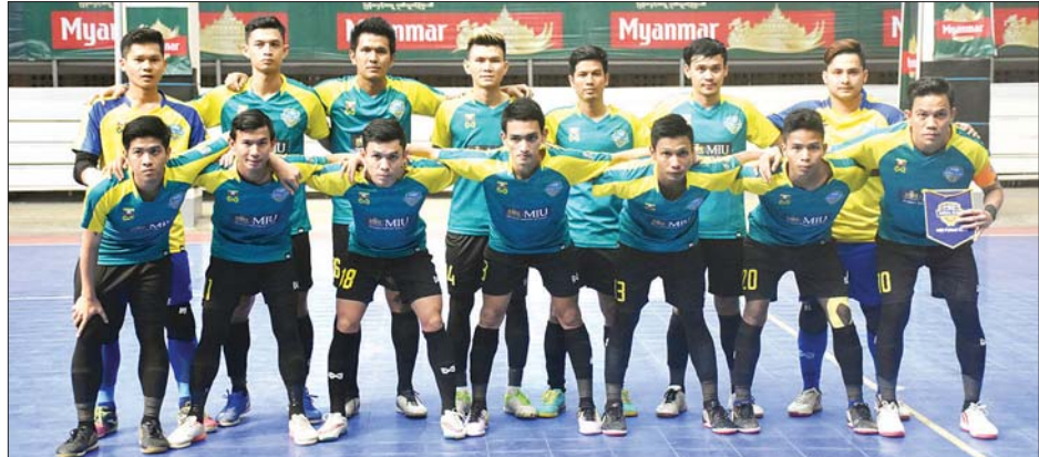
မြန်မာ့ဖူဆယ်ကလပ်အသင်းမှ အားကစားသမားများအား တွေ့ရစဉ်။

ပြိုင်ပွဲကို ယူအေအီးနိုင်ငံတို့တွင် ကျင်းပမည်ဖြစ်သော်လည်း ကိုရိုနာဗိုင်းရပ်စ်အခြေအနေကြောင့် ကျင်းပမည်ရက် ပြန်လည်အတည်ပြုမည်ဖြစ်သည်။ MIU ဖူဆယ်အသင်း သည် အာဆီယံ ဖူဆယ်ကလပ်ပြိုင်ပွဲတွင် ၂၀၁၅၊ ၂၀၁၆၊ ၂၀၁၈ နှင့် ၂၀၁၉ ခုနှစ်တို့တွင် ဝင်ရောက်ယှဉ်ပြိုင်ဖူးပြီး လေးကြိမ်စလုံး တတိယဆုရရှိခဲ့သည်။ အာဆီယံ ဖူဆယ် ကလပ်ပြိုင်ပွဲကို ၂၀၁၅ ခုနှစ်တွင် စတင်ကျင်းပခဲ့ပြီး ငါးကြိမ်ကျင်းပပြီးစီးခဲ့ကာ ၂၀၁၇ ပြိုင်ပွဲတွင် PU အသင်း ယှဉ်ပြိုင်ခွင့်ရခဲ့သည်။ အာရှကလပ်ပြိုင်ပွဲကိုမူ မြန်မာ ဖူဆယ်ကလပ်အသင်းများအနေဖြင့် ၂၀၁၈ ခုနှစ်မှစတင် ယှဉ်ပြိုင်ခွင့်ရခဲ့ပြီး ၂၀၁၈ နှင့် ၂၀၁၉ ခုနှစ်ကြိမ်စလုံးတွင် MIU အသင်း ဝင်ရောက်ယှဉ်ပြိုင်ခြင်းမရှိသောကြောင့် VUC အသင်းက အစားထိုးယှဉ်ပြိုင်ခဲ့သည်။ MIU အသင်းသည် ကိုရိုနာဗိုင်းရပ်စ်ကြောင့် လေ့ကျင့်မှု ရပ်နားထားသော်လည်း ယခုနှစ်အတွင်း ယှဉ်ပြိုင်ရမည့် နိုင်ငံတကာပြိုင်ပွဲများနှင့် ပြည်တွင်းပြိုင်ပွဲများအတွက် ရောဂါအခြေအနေပျောက်ကင်းသွားပါက ပြန်လည် လေ့ကျင့်သွားမည်ဖြစ်သည်။ ညီမြတ်သော်တာ