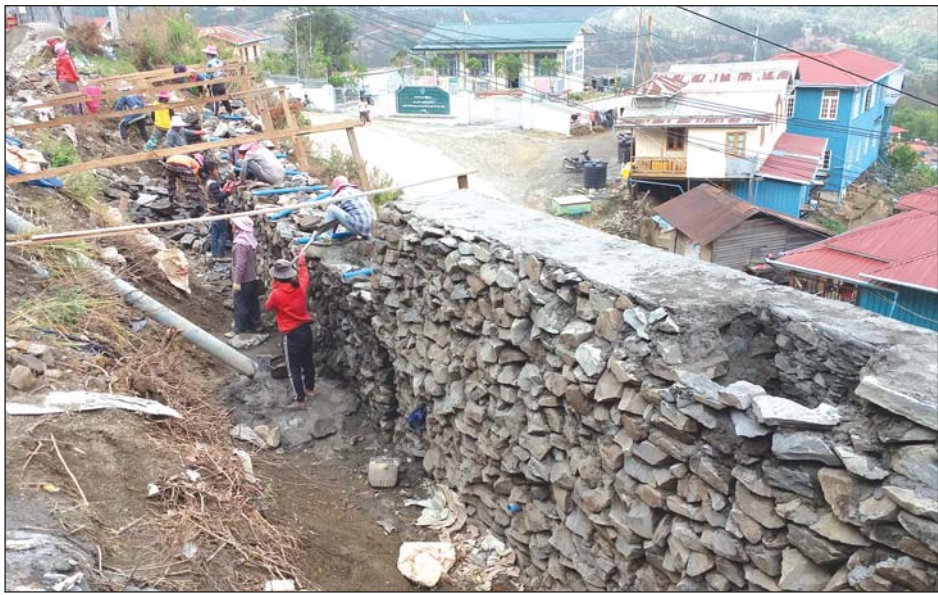
လမ်းပေါ်သို့ မြေမြှုပ်ကျမှု မဖြစ်ပွားစေရန် မြေထိန်းနံရံ တည်ဆောက်နေစဉ်