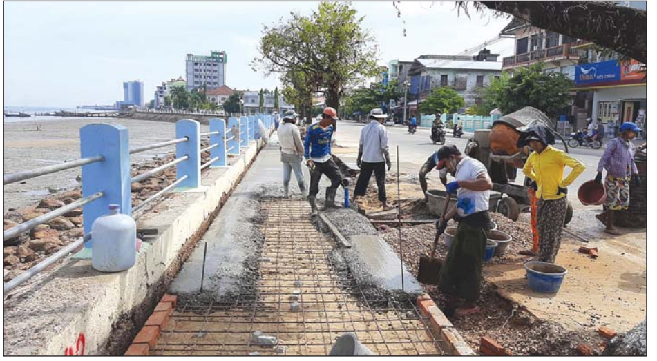
ပလက်ဖောင်းတစ်လျှောက် အမာခံ ကွန်ကရစ်ခင်းခြင်းလုပ်ငန်းများ ဆောင်ရွက်စဉ်

"မြိတ်မြို့ပင်လယ်ဆိပ်ကမ်းမြို့ ဖြစ်တဲ့အတွက် ကမ်းနားလမ်းကို မြို့သူမြို့သားများက အပန်းဖြေနေရာ တစ်ခုအဖြစ် သတ်မှတ်ထားကြပါ တယ်။ လက်ရှိမှာလည်း မြို့သူမြို့သား တွေဟာ လမ်းလျှောက်ခြင်း၊ အနားယူ ခြင်း၊ ပင်လယ်လေရှုခြင်းကို ကမ်းနား လမ်းမှာ အများဆုံး ပြုလုပ်တဲ့အတွက် မြို့နယ်စည်ပင်သာယာရေးအဖွဲ့အနေနဲ့ အဓိကဦးစားပေးပြီး ပလက်ဖောင်းကို အဆင့်မြှင့်တင်ဖို့ ဆောင်ရွက်နေခြင်း ဖြစ်ပါတယ်။ တိုင်းဒေသကြီးအစိုးရ အဖွဲ့ ခွင့်ပြုရန်ပုံငွေ ကျပ် ၂၂၂ သန်းနဲ့ ကမ်းနားလမ်းပလက်ဖောင်း အဆင့် မြှင့်တင်ခြင်းကို ဆောင်ရွက်သွားမှာ ဖြစ်ပါတယ်။ ပလက်ဖောင်းရဲ့အရှေ့မှာ ယခင်က ရေတမာပင်တွေ စိုက်ပျိုး ထားပါတယ်။ ရေတမာပင်တွေကြား မှာ အပွင့်ပွင့်နေတဲ့ အပင်လေးတွေကို