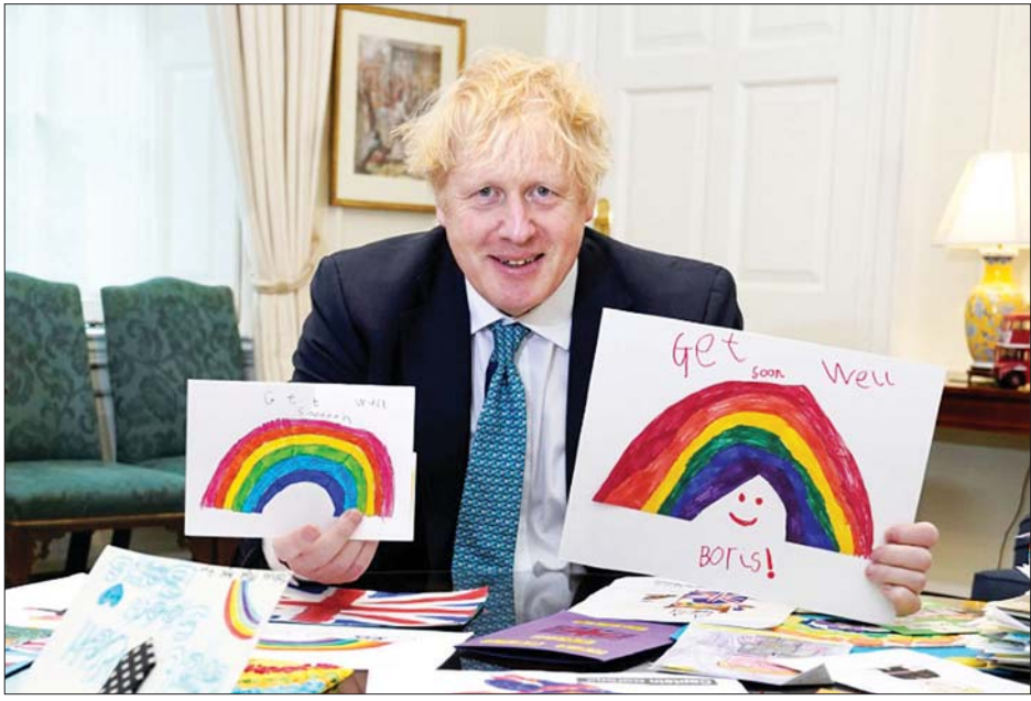
ဗြိတိန်ဝန်ကြီးချုပ် ဘောရစ်ဂျွန်ဆင် သတိကြီးစွာထား ကိုယ်ပိုင်အတွေ့အကြုံများက ပိတ်ဆို့ကန့်သတ်မှုနှင့် ပတ်သက်ပြီး ဆုံးဖြတ်ချက်ချရာတွင် လွှမ်းမိုးမှုရှိနိုင်သည်ဟု မီဒီယာများတွင် ဖော်ပြကြသည်။ အင်န်အိတ်ချီကေ

လန်ဒန် မေ ၃ ဗြိတိန်ဝန်ကြီးချုပ် ဘောရစ်ဂျွန်ဆင်က ကိုဗစ်- ၁၉ ကူးစက်ခံရစဉ်က အကြောင်း များကို ပြန်ပြောပြရာ၌ ၎င်းသေဆုံးကြောင်း ကြေညာရန်ပင် ဆရာဝန်များက အသင့်ပြင်ထားသည်ဟု ရောဂါအခြေအနေ ဆိုးရွားခဲ့ပုံကို ပြောပြခဲ့သည်။ လက်မခံနိုင်အောင်ဆိုးရွား မေ ၁ ရက်ကထုတ်ဝေသည့် သည်ဆန်းသတင်းစာနှင့် အင်တာဗျူးတွင် ဗြိတိန်ဝန်ကြီးချုပ် ဘောရစ်ဂျွန်ဆင်က အခုလို ပြောပြခဲ့ခြင်းဖြစ်သည်။ ကိုဗစ်- ၁၉ ကူးစက်ခံရသည်ဟု သိရှိပြီးနောက်ပိုင်း ရောဂါအခြေအနေမှာ လက်မခံနိုင် လောက်အောင် ဆိုးရွားခဲ့သည်ဟု ဗြိတိန်ဝန်ကြီးချုပ်က ပြောကြားခဲ့သည်။ ကြိုတင်စီစဉ်ခဲ့ ကျန်းမာရေးအခြေအနေ ဆိုးရွားလာသည့်နောက် လန်ဒန်ဆေးရုံသို့ တက်ခဲ့ ရသည်။ ဆေးရုံတွင်လည်း ဘောရစ်ဂျွန်ဆင်ကို အောက်ဆီဂျင်အကြာကြီး ပေးထားရသည်။ ထို့နောက် အခြေအနေပိုဆိုးရွားလာသည့်အတွက် အထူး ကြပ်မတ်ကုသဆောင်သို့ ပို့ခဲ့ရသည်။ ဆေးရုံမှ ဆရာဝန်များအားလုံးက ဝန်ကြီးချုပ်၏ အခြေအနေ ပိုဆိုးရွားလာပါက ပြင်ဆင်နိုင်အောင် ကြိုတင် စီစဉ်ခဲ့ကြသည်။ အစားထိုးနိုင်ရေးပြင်ဆင်ခဲ့ မစ္စတာ ဘောရစ်ဂျွန်ဆင်က ၎င်းအနေဖြင့် ပထမဆုံးအကြိမ် သေဘေးနှင့် နီးစပ်ခဲ့ခြင်းဖြစ်သည်ဟု ဝန်ခံခဲ့သည်။ အစိုးရအဖွဲ့သည်လည်း အရေးပေါ် အခြေအနေ၌ ၎င်းနေရာတွင်အစားထိုးနိုင်ရေးကိုလည်း ပြင်ဆင်ခဲ့ကြသည်။ ယခုအခါတွင် မစ္စတာဘောရစ်ဂျွန်ဆင်၌ သားလေးရလာပြီဖြစ်ပြီး ၎င်းကို ကုသပေးခဲ့သည့် ဆရာဝန်နှစ်ဦး၏ အမည်ကိုဂုဏ်ပြုကာ သားဖြစ်သူကို နာမည်ပေးမည်ဟု ဘောရစ်ဂျွန်ဆင်က ပြောသည်။