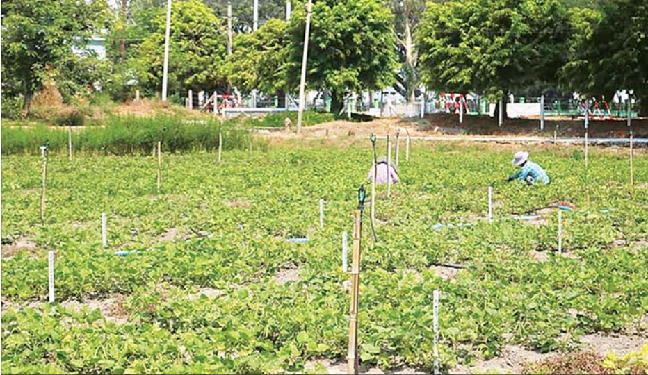
အဝါရောင်မှိုစေ့ရောဂါဒဏ် ခံနိုင်ရည်ရှိသော ပဲတီစိမ်းမျိုးလိုင်း စိုက်ခင်းကို တွေ့ရစဉ်။

သုတေသနဌာနခွဲ ပဲမျိုးစုံသီးနှံ သုတေ သန ဌာနစုမှ သုတေသနပညာရှင် များသည် ပဲတီစိမ်း၊ မတ်ပဲ၊ ကုလားပဲ၊ ပဲစင်းငုံ၊ ပဲပုပ်နှင့် ပဲလွန်းအပါအဝင် ပဲမျိုးစုံသီးနှံများကို ရေ၊ မြေ၊ ရာသီဥတု ကွဲပြားခြားနားသော ဒေသအသီးသီး နှင့် သင့်တော်သော အထွက်ကောင်း မျိုးများ ရှာဖွေဖော်ထုတ်ခြင်း၊ ဈေးကွက်နှင့် ကိုက်ညီသော မျိုးများ