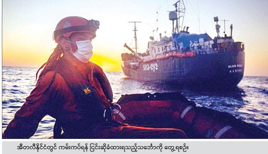
အီတလီနိုင်ငံတွင် ကမ်းကပ်ရန် ငြင်းဆိုခံထားရသည့်သင်္ဘောကို တွေ့ရစဉ်။

ခတ္တမန္တူ ဧပြီ ၂၀ နီပေါနိုင်ငံ၏အပြည်ပြည်ဆိုင်ရာကုန်သွယ်မှုသည် ၂၀၁၉ ခုနှစ် ဇူလိုင်လလယ်မှစတင်သည့် ၂၀၁၉-၂၀၂၀ ဘဏ္ဍာနှစ် ပထမကူးလတာအတွက် ၆ ရာခိုင်နှုန်း ကျဆင်းခဲ့သည်။ ကိုဗစ် - ၁၉ ကြောင့် အသွားအလာပိတ်ဆို့ကန့်သတ်မှုများနှင့် တစ်ကမ္ဘာလုံးဆိုင်ရာ ထောက်ပံ့ရေး ဆက်သွယ်မှုပြတ်တောက်သွားသည့်အတွက် ကျဆင်းခြင်းဖြစ်သည်ဟု နီပေါအကောက်ခွန်ဌာနက ပြောသည်။