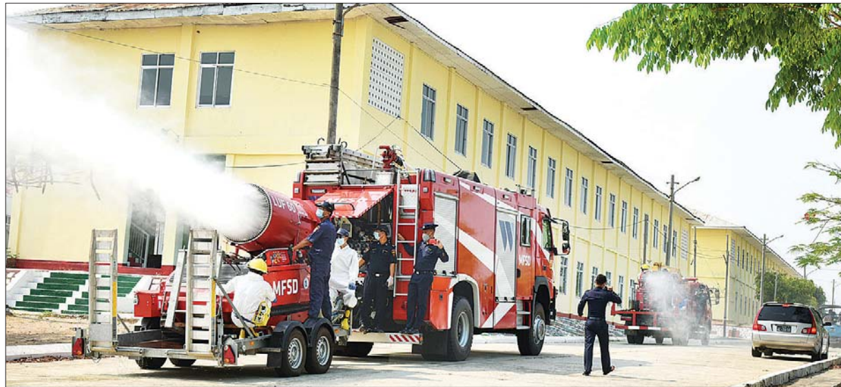
နေပြည်တော် ဧပြီ ၂၀ ပြည်ထောင်စုနယ်မြေ နေပြည်တော်အတွင်း ကိုဗစ်-၁၉ ရောဂါ ကြိုတင် ကာကွယ်ရေးအတွက် အမှတ်(၃)စစ်ကြောရေးနှင့် တည်းခိုရေးစခန်း(ရွာတော်)၊ နေပြည်တော်ဘူတာကြီး(ရွာတော်)၊ ပုဗ္ဗသီရိမြို့နယ် နဝဒေးရပ်ကွက် အထက် (၂၀)နှင့် တပင်ရွှေထီးရပ်ကွက် စစ်မှုထမ်းဟောင်းအိမ်ရာတို့တွင် ပိုးသတ်ဆေး ဖျန်းခြင်းလုပ်ငန်းများကို ယနေ့ မွန်းလွဲပိုင်းက ဆောင်ရွက်ခဲ့သည်။ (အပေါ်ပုံ) ထိုသို့ဆောင်ရွက်ရာတွင် နေပြည်တော်တိုင်းစစ်ဌာနချုပ်မှ ဆေးဖျန်း ယာဉ်နှစ်စီး၊ စာမျက်နှာ ၇ ကော်လံ ၄