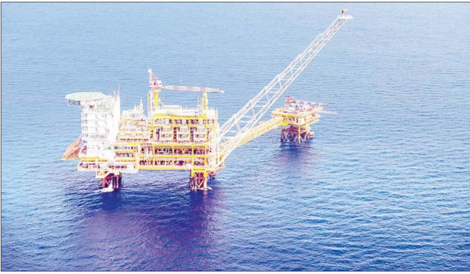
မုတ္တမပင်လယ်ကွေ့ရှိ ဇေတီကစီမံကိန်းတစ်ခုကို တွေ့ရစဉ်။