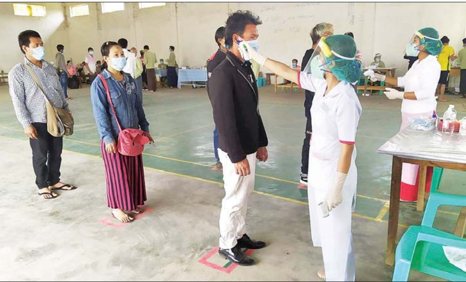
တရုတ်နိုင်ငံမှ ပြန်လည်ဝင်ရောက်လာသူများကို ကျန်းမာရေးစစ်ဆေးမှု ပြုလုပ်နေစဉ်။

လွယ်ဂျယ် ဧပြီ ၂၀ တရုတ်ပြည်သူ့သမ္မတနိုင်ငံ ယူနန်ပြည်နယ် လုံခြုံခရိုင်မှ မြန်မာနိုင်ငံသို့ ဝင်ရောက်လာသူများကို ဧပြီ ၁၆ ရက်မှ စတင်လက်ခံဆောင်ရွက်လျက်ရှိရာ ယနေ့အထိ နေရပ်ပြန်လည်ဝင်ရောက်လာသူ မြန်မာနိုင်ငံသား စုစုပေါင်း ၁၈၇၄ ဦး ရှိပြီဖြစ်ကြောင်း သိရသည်။ ဧပြီ ၂၀ ရက်အထိ နေရပ်ပြန်လာသူ မြစ်ကြီးနားမြို့နယ်တွင် လေးဦး၊ ဝိုင်းမော်မြို့နယ်တွင် နှစ်ဦး၊ မိုးကောင်း မြို့နယ်တွင် ၁၄ ဦး၊ မိုးညှင်းမြို့နယ်တွင် ငါးဦးနှင့် ဗန်းမော်ခရိုင်အတွင်းရှိ ဗန်းမော်မြို့နယ်တွင် ၂၇ ဦး၊ မိုးမောက်မြို့နယ် တွင် ၇၈ ဦး၊ ရွှေကူမြို့နယ်တွင် ၁၁ ဦး၊ မန်စီမြို့နယ်တွင် ၂၇ ဦးရှိရာ ၎င်းတို့ကို ယာဉ်ငယ် ၁၈ စီးဖြင့် ဗန်းမော်ခရိုင်အတွင်း မြို့နယ်များရှိ နေရပ်ပြန်များကို မိုးမောက်မြို့နယ် ကျောက်စခန်းကျေးရွာရှိ စုရပ်စခန်းသို့ လည်းကောင်း၊ မြစ်ကြီးနားခရိုင်နှင့် မိုးညှင်းခရိုင်သို့ နေရပ်ပြန်များကို မြစ်ကြီးနား စီတာပူ ကုန်ချစခန်းစုရပ်သို့ လည်းကောင်း ပို့ဆောင်ပေးလျက်ရှိကြောင်း သိရသည်။ ထို့အပြင် လွယ်ဂျယ်မြို့ ကန့်သတ်စောင့်ကြည့်ရေးစခန်းများတွင် အမျိုးသား ၁၃၄ ဦး၊ အမျိုးသမီး ၄၇ ဦး စုစုပေါင်း ၁၈၁ ဦးတို့ကို ၂၀ ရက် ကန့်သတ် စောင့်ကြည့်ရန်ထားရှိပြီး လိုအပ်သည့်အစီအမံများ ဆောင်ရွက်ပေးလျက် ရှိသည်။ တရုတ်နိုင်ငံမှ ဝင်ရောက်လာသူများကို ကျန်းမာရေးစစ်ဆေးမှုအရ ကိုဗစ်-၁၉ ရောဂါနှင့် ပတ်သက်၍ သံသယရောဂါလက္ခဏာပြသ တစ်ဦး တစ်ယောက်မျှ မတွေ့ရှိကြောင်း သိရသည်။ ထွန်းထွန်းနိုင်(ပြန်/ဆက်)