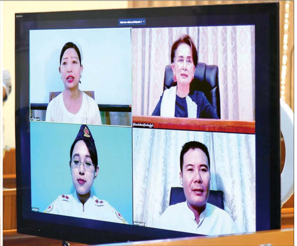
Coronavirus Disease 2019 (COVID-19) ကာကွယ်၊ ထိန်းချုပ်၊ ကုသရေး အမျိုးသားအဆင့် ဗဟိုကော်မတီဥက္ကဋ္ဌ၊ နိုင်ငံတော်၏အတိုင်ပင်ခံပုဂ္ဂိုလ် ဒေါ်အောင်ဆန်းစုကြည် COVID-19 ကာကွယ်၊ ထိန်းချုပ်၊ ကုသရေးလုပ်ငန်းများတွင် ပါဝင်ဆောင်ရွက်နေသည့် ဧရာဝတီတိုင်းဒေသကြီးမှ ပြည်သူများနှင့် Video Conferencing စနစ်ဖြင့် ချိတ်ဆက်တွေ့ဆုံ၍ လက်တွေ့အခြေအနေများအား အပြန်အလှန်ဆွေးနွေးစဉ်။ သတင်းစဉ်