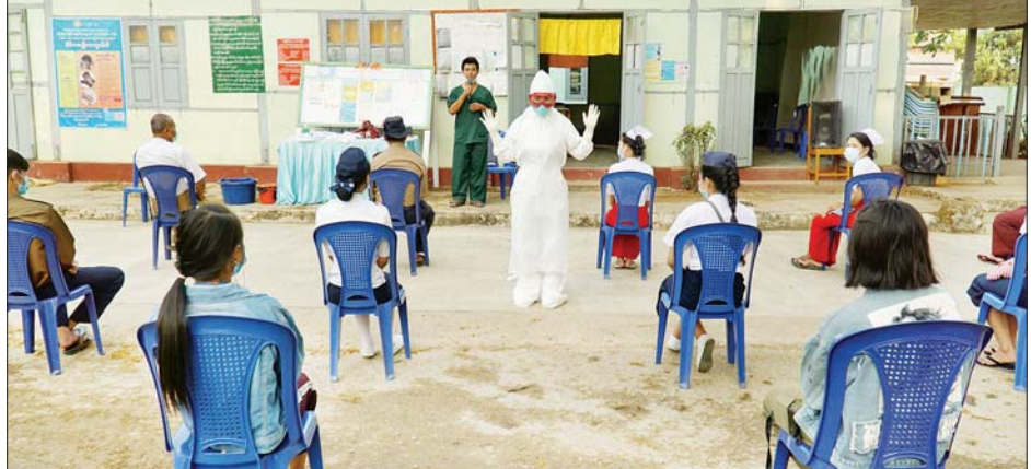
ကိုဗစ်-၁၉ နှင့်ပတ်သက်၍ ရောဂါကာကွယ်ရေးဝတ်စုံပြည့် ဝတ်ဆင်မှုသရုပ်ပြပေးစဉ်။