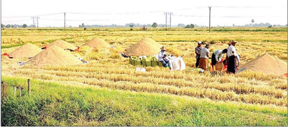
ရေတာရှည်မြို့နယ်၌ နွေစပါးရိတ်သိမ်းခြွေလှေ့ပြီး အရောင်းအဝယ်ဖြစ်လျက်ရှိသည်ကို တွေ့ရစဉ်။

ရေတာရှည် ဧပြီ ၂၀ ပဲခူးတိုင်းဒေသကြီး ရေတာရှည် မြို့နယ် ဆွာဆည်တံခံရေသောက် နွေစပါးစိုက်ခင်းများ ရိတ်သိမ်းလျက် ရှိပြီး ယခုလက်ရှိ စပါးဖြိုင်ဖြိုင်ပေါ်ချိန် တွင် ရောင်းလိုအားနှင့် ဝယ်လိုအား ကို ချိန်တွက်ကာ ကုန်သည်များက ဈေးနှုန်းကို ထိန်းချုပ်လျက်ရှိ၍ စပါး အစိုတင်း ၁၀၀ လျှင် ကျပ် ၄၈၀၀၀၀ အထိ ကျဆင်းခဲ့ကြောင်း သိရ သည်။