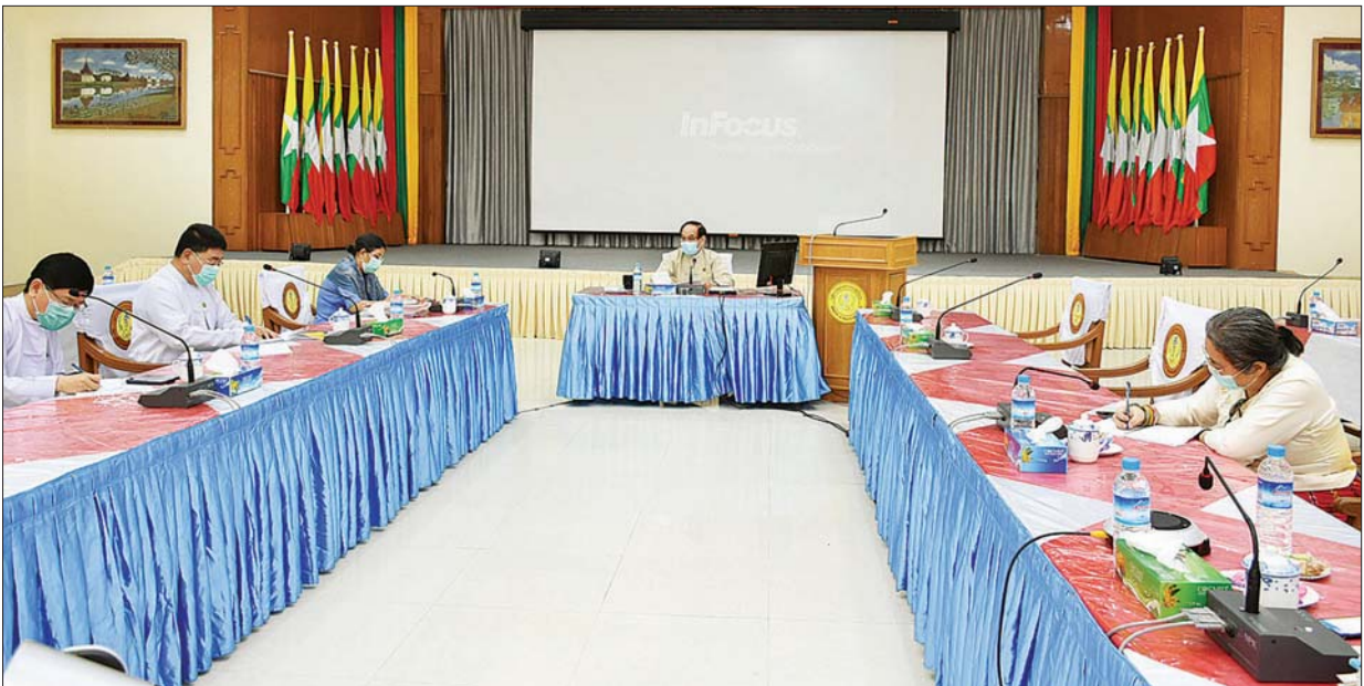
ကျန်းမာရေးနှင့် အားကစားဝန်ကြီးဌာန၊ တိုင်းဒေသကြီး၊ ပြည်နယ်များ၌ COVID-19 ကာကွယ်၊ ထိန်းချုပ်၊ ကုသမှုလုပ်ငန်းများကို ဆောင်ရွက်မှု အခြေအနေများ ခြုံငုံဆန်းစစ်ခြင်း အစည်းအဝေးကျင်းပစဉ်။

ယနေ့အစည်းအဝေးတွင် ဆောင်ရွက်ပြီးစီးခဲ့သော လုပ်ငန်းများ၊ ဆောင်ရွက်နေဆဲ လုပ်ငန်းများနှင့် ရှေ့ဆက်လက်ဆောင်ရွက်သွားမည့် လုပ်ငန်းများ၊ လုပ်ငန်းဆောင်ရွက်ရာတွင် တွေ့ကြုံရသည့် အခက်အခဲနှင့် စိန်ခေါ်မှုများကို ပွင့်ပွင့်လင်းလင်း ပေါင်းစပ်ညှိနှိုင်း ဆွေးနွေးစေလိုပါကြောင်း၊ လိုအပ်သည့် ဆေးနှင့် ဆေးပစ္စည်းများ၊ တစ်ကိုယ်ရည်ကူးစက်ရောဂါ ကာကွယ်ရေးဝတ်စုံနှင့် အသုံးအဆောင်များကို အသုံးပြုမှုနှုန်းထားပုံစံများကို လေ့လာ၍ သိပ္ပံနည်းကျတွက်ချက်ကာ လျော့နည်းကုန်ဆုံးလာမည့်