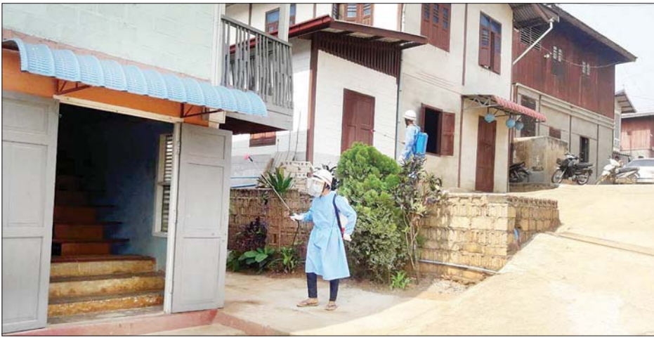
အလှူရှင်များ၏ လှူဒါန်းမှုဖြင့် ဟိုပုံးမြို့ပေါ်ရပ်ကွက်နှင့် ကျေးရွာများအား ပိုးသတ်ဆေးဖျန်းပေးနေစဉ်။