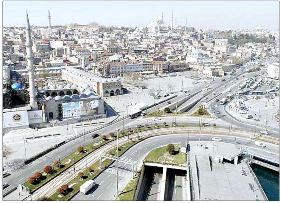
တူရကီနိုင်ငံ၌ ကပ်ရောဂါကျရောက်ပြီးနောက် မြို့တွင်း၌ ယာဉ်များအသွားအလာနည်းပါးသည့် အခြေအနေကို တွေ့ရစဉ်။

ဦးအထိ ဖြစ်လာခဲ့သည်။ တူရကီနိုင်ငံသည် အရှေ့အလယ်ပိုင်းဒေသတွင် အီရန်ပြီးလျှင် ရောဂါကူးစက်ဖြစ်ပွားမှုနှုန်း အမြင့်ဆုံးဖြစ်ကြောင်း ဂျွန်ဟော့ကင်းတက္ကသိုလ်မှ ဖော်ပြသည့် ကိန်းဂဏန်းများအရ သိရသည်။