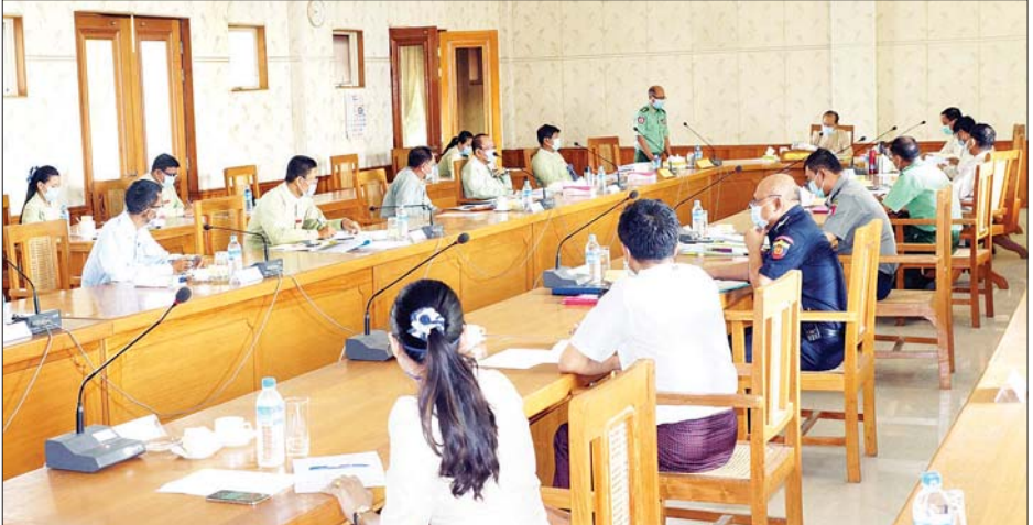
အလုပ်ရုံများ ပုံမှန်လည်ပတ်ရန်ကိစ္စနှင့် ကျန်းမာရေး ဒေါက်တာမျိုးအောင်က ပြည့်စွက်ဆွေးနွေးခဲ့ကြောင်း ကိစ္စရပ်များကို သက်ဆိုင်ရာကဏ္ဍအလိုက် ရှင်းလင်း သိရသည်။ ဆွေးနွေးတင်ပြကြရာ နေပြည်တော်ကောင်စီဥက္ကဋ္ဌ ထွန်းထွန်းဝင်း(ပြန်/ဆက်)

အလေးထားဆောင်ရွက်ကြရန်၊ သက်ဆိုင်ရာလုပ်ငန်း ကော်မတီများအလိုက် စီမံချက်များရေးဆွဲပြီး အကောင်အထည်ဖော် ဆောင်ရွက်ကြရန် တိုက်တွန်း ပြောကြားသည်။ ထို့နောက် ကော်မတီအတွင်းရေးမှူး နေပြည်တော် ကောင်စီဝင် ဗိုလ်မှူးကြီးမင်းနောင်က ကောင်မတီ၏ ဆောင်ရွက်ရမည့် လုပ်ငန်းစဉ်များနှင့်စပ်လျဉ်း၍ ရှင်းလင်း တင်ပြသည်။ (ယာဝုံ) ယင်းနောက် ကော်မတီအဖွဲ့ဝင်များဖြစ်ကြသည့် နေပြည်တော်ကောင်စီဝင်များ၊ နေပြည်တော်တိုင်းစစ်ဌာန ချုပ် ဒုတိယတိုင်းမှူး၊ နေပြည်တော် ပြည်သူ့ကျန်းမာရေး ဦးစီးဌာန ဒုတိယညွှန်ကြားရေးမှူးချုပ်၊ နေပြည်တော် ရဲတပ်ဖွဲ့မှူးရုံး၊ ရဲတပ်ဖွဲ့မှူး၊ နေပြည်တော်မီးသတ်ဦးစီးဌာန ညွှန်ကြားရေးမှူးနှင့် နေပြည်တော်ကောင်စီအတွင်းရေးမှူး တို့က Community Base နေရာများသတ်မှတ်ခြင်း၊ ရိက္ခာများစီမံခန့်ခွဲခြင်း၊ သယ်ယူပို့ဆောင်ရေး၊ လုံခြုံရေး အစီအမံများ၊ လှုံ့ဆော်ပြန်ကြားရန်စွဲရပ်များ၊ စက်ရုံ