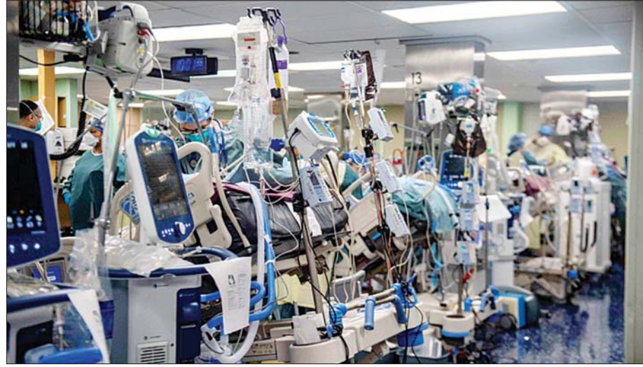
အမေရိကန်ဆေးရုံသင်္ဘောပေါ်ရှိ အထူးကြပ်မတ်ကုသဆောင်တွင် ရေတပ်တပ်ဖွဲ့ဝင်များက ကိုဗစ်-၁၉ လူနာ များကို ကုသနေစဉ်။

ကိုဗစ်-၁၉ တားဆီးကာကွယ်တဲ့နေရာမှာ သိသာ ထင်ရှားတဲ့ သက်သေသဘာဝတွေအရ အလုပ်ပိတ် ကန့်သတ်ခြင်းတွေ၊ ခပ်ခွာခွာနေထိုင်ခြင်းတွေဟာ ထိရောက်တဲ့နည်းလမ်းတွေ ဖြစ်ခဲ့ပါတယ်။ နိုင်ငံများစွာ မှာ အသွားအလာလုပ်ငန်းတွေကို လျော့ချဖို့နဲ့ နိုင်ငံ စီးပွားရေးအပေါ် ဖိအားသက်ရောက်မှုတွေကို လျော့ချဖို့ ဒီလိုနည်းလမ်းတွေကို တွင်တွင်ကျယ်ကျယ်အသုံးပြု လာကြပါတယ်။ ကိုဗစ်-၁၉ ရိုက်ခတ်မှုဒဏ်ကိုခံစားနေရ တဲ့ စပိန်နိုင်ငံမှာ နိုင်ငံလုံးဆိုင်ရာ အလုပ်ပိတ် ကန့်သတ်မှု တွေကို ထပ်မံတိုးချဲ့လိုက်သော်လည်း ကလေးတွေ အပြင်ထွက်ခွင့်ကန့်သတ်ချက်ကိုတော့ ပြေလျော့ပေး ထားပါတယ်။