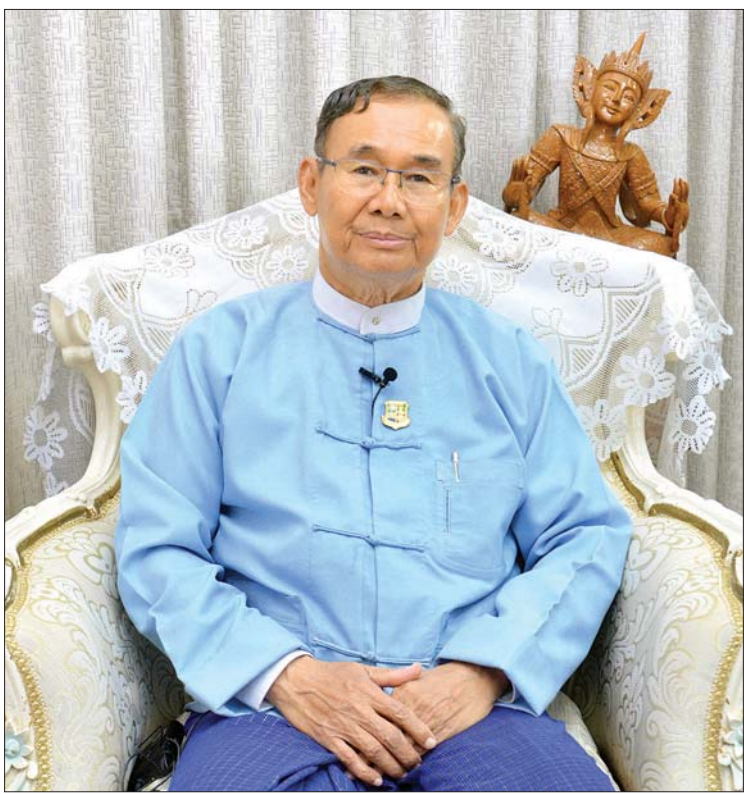
ပြည်ထောင်စုဝန်ကြီး ဦးအုန်းဝင်း

ဇီဝမျိုးစုံမျိုးကွဲတွေကို ရေရှည်တည်တံ့ အောင် ထိန်းသိမ်းစောင့်ရှောက်နိုင်ဖို့ တော ရိုင်းတိရစ္ဆာန်တွေ နေရင်းဒေသ ပြန်လည်တည် ထောင်ရေးလုပ်ငန်း အစီအစဉ် ၂၀၁၉-၂၀၂၀ မှ ၂၀၂၈-၂၀၂၉ အထိ ဆောင်ရွက်လျက်ရှိရာ စီမံကိန်းလုပ်ငန်းတွေကို ၂၅ ဒသမ ၉၇ ရာခိုင် နှုန်း ဆောင်ရွက်ထားပြီး ဖြစ်ပါတယ်။ ၂၀၁၉ ခုနှစ်မှာ ထမံသီ တောရိုင်းတိရစ္ဆာန်ဘေးမဲ့ တောကို အာဆီယံအမွေအနှစ်ဥယျာဉ်အဖြစ် သတ်မှတ်ခံခဲ့ရပါတယ်။ ဒါဟာ ဂုဏ်ယူစရာ