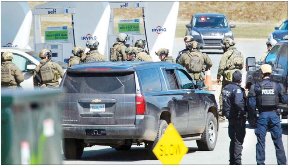
အခင်းဖြစ်ပွားသည့် နေရာ၌ ရဲတပ်ဖွဲ့ဝင်များ စစ်ဆေးနေစဉ်။

ဧပြီ ၁၉ ရက်နံနက်ပိုင်းတွင် ဓာတ်ဆီအရောင်းဆိုင်တစ်ဆိုင် အနီး၌ ရဲတပ်ဖွဲ့က အသေပစ်ခတ် ဖမ်းဆီးခဲ့ရသည်။ သေနတ်ပစ်ခတ်မှုအတွင်း နောက်ထပ်သေဆုံးသူ ရှိ မရှိကို ရဲတပ်ဖွဲ့က စုံစမ်းစစ်ဆေးမှုများ လုပ်ဆောင်လျက်ရှိသည်။ သေနတ်သမားမှာ သွားဆေးခန်းတစ်ခုဖွင့်ထားသူ ဖြစ်ကြောင်း ဒေသမီဒီယာက ဖော်ပြသည်။ ကနေဒါဝန်ကြီးချုပ် ဂျပ်စတင်ထရူးဒိုက သေနတ်ပစ်ခတ်မှုအတွင်း အသက်ဆုံးရှုံးခဲ့ရသူများ၏ မိသားစုဝင်များနှင့်ထပ်တူ ဝမ်းနည်းကြေကွဲခံစားရကြောင်း ဧပြီ ၁၉ ရက်တွင် ထုတ်ပြန်ခဲ့သည်။ ကနေဒါနိုင်ငံ၌ သေနတ်ပစ်ခတ်မှုထိန်းချုပ်ရေး ဥပဒေ တစ်ရပ်ပြဋ္ဌာန်းထားပြီး နိုင်ငံအတွင်း သေနတ်ပစ်ခတ်မှုများ ဖြစ်ပွားမှုနည်းကြောင်း သိရသည်။ အင်န်အိတ်ချ်ကော