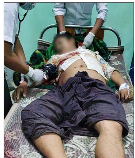
အရပ်သားဝန်ထမ်းနှစ်ဦး ဆေးကုသမှုခံယူနေစဉ်။ ကဲ့သို့ ပစ်ခတ်တိုက်ခိုက်ခြင်းမှာ လူသားမဆန်သည့် ပြောဆိုနေကြသည်။ အကြမ်းဖက်လုပ်ရပ်သဖြင့်ကြောင်း ဝေဖန်ထောက်ပြ သတင်းစဉ်