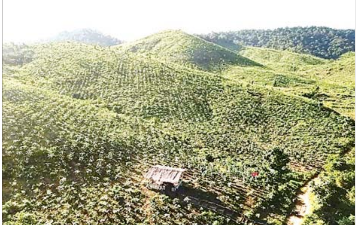
စစ်ကိုင်းတိုင်းဒေသကြီး ကသာခရိုင် ကောလင်းမြို့နယ် ကျွန်းတောကြီးပြင်ကာကွယ်တောရှိ စီးပွားရေးကျွန်းစိုက်ခင်း ဧက ၂၅၀ စိုက်ပျိုးထားမှုကို တွေ့ရစဉ်။

နိုင်ခဲ့ပါတယ်။ ဒါ့အပြင် အပူပိုင်းဒေသမှာ ရေရရှိဖို့ စတုတ္ထ (၁) နှစ်တာကာလအတွင်း ရေကန်ငယ် ၂၁ ကန်၊ ကျောက်စီနုနုထိန်းတစ်ငယ် ၁၂၂ ခု၊ မြေအောက်ရေ(အဝီစိတွင်း) ၃ တွင်း၊ ဂါလန် ၅၀၀၀ ဆွဲ မိုးရေစုကန် ၁၂ ကန်နဲ့ ဂါလန် ၁၀၀ ဆွဲ မိုးရေခံကွန်ကရစ်ကန် ၁၃၀၀ ဆောင်ရွက် ပေးလျက်ရှိပါတယ်။ အချစ်ပို (ခ) သို့