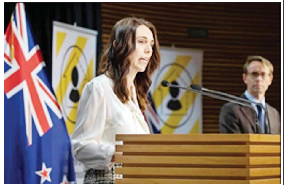
နယူးဇီလန်ဝန်ကြီးချုပ် ဂျက်ဆင်ဒါအာဒန်

ဝယ်လင်တန် ဧပြီ ၂၀ နယူးဇီလန်နိုင်ငံတွင် ကိုဗစ် - ၁၉ ကာကွယ်ရေးနှင့် ပတ်သက်ပြီး သတိပေးမှုအဆင့်များကို လျှော့ချရန် ပြင်ဆင်လျက်ရှိပြီး နောက်ထပ်တစ်ပတ်ကြာ အသွားအလာပိတ်ဆို့ကန့်သတ်မှုများကို ဆက်လက်ပြုလုပ်သွားမည်ဟု သိရသည်။