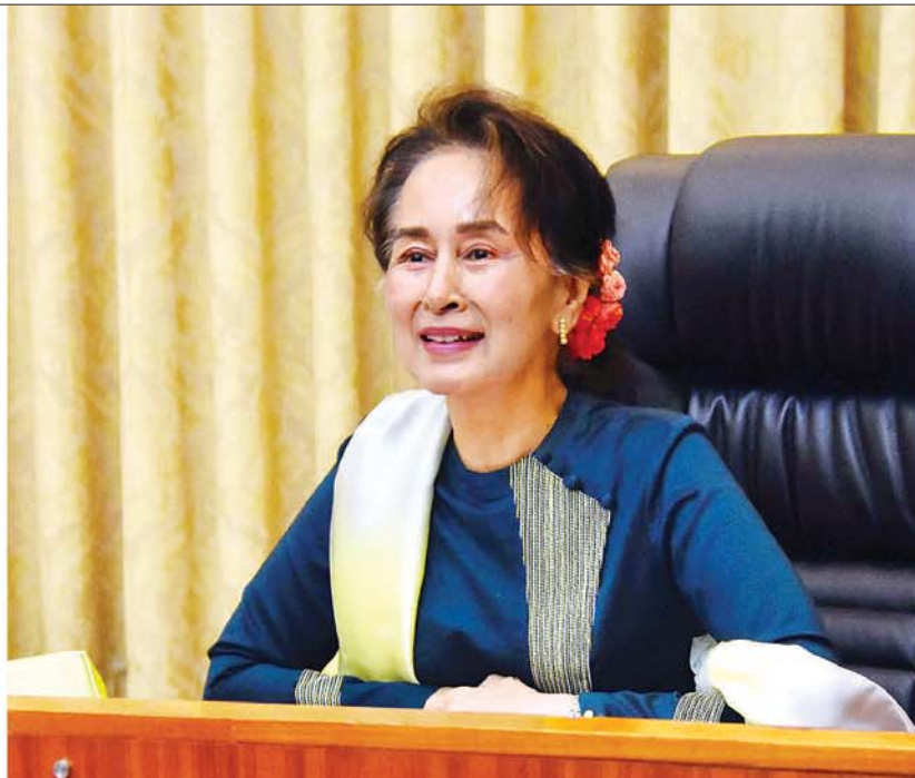
Coronavirus Disease 2019 (COVID-19) ကာကွယ်၊ ထိန်းချုပ်၊ ကုသရေး အမျိုးသားအဆင့် ဗဟိုကော်မတီဥက္ကဋ္ဌ၊ နိုင်ငံတော်၏အတိုင်ပင်ခံပုဂ္ဂိုလ် ဒေါ်အောင်ဆန်းစုကြည် COVID-19 ကာကွယ်၊ ထိန်းချုပ်၊ ကုသရေးလုပ်ငန်းများ တွင် ပါဝင်ဆောင်ရွက်နေသည့် ဧရာဝတီတိုင်းဒေသကြီးမှ ပြည်သူများနှင့် Video Conferencing စနစ်ဖြင့် ချိတ်ဆက်တွေ့ဆုံ၍ လက်တွေ့အခြေအနေများအား အပြန်အလှန်ဆွေးနွေးစဉ်။ သတင်းစဉ်

နေပြည်တော် ဧပြီ ၂၀ Coronavirus Disease 2019 (COVID-19) ကာကွယ်၊ ထိန်းချုပ်၊ ကုသရေး အမျိုးသားအဆင့် ဗဟိုကော်မတီ ဥက္ကဋ္ဌ၊ နိုင်ငံတော်၏အတိုင်ပင်ခံပုဂ္ဂိုလ် ဒေါ်အောင်ဆန်းစုကြည်သည် ယနေ့ နံနက်ပိုင်းတွင် နေပြည်တော်ရှိ နိုင်ငံတော် သမ္မတအိမ်တော် အစည်းအဝေးခန်းမ၌ COVID-19 ကာကွယ်၊ ထိန်းချုပ်၊ ကုသရေးလုပ်ငန်းများတွင် ပါဝင်ဆောင်ရွက် နေသည့် ဧရာဝတီတိုင်းဒေသကြီးမှ ပြည်သူများနှင့် Video Conferencing စနစ်ဖြင့် ချိတ်ဆက်တွေ့ဆုံ၍ လက်တွေ့ အခြေအနေများအား အပြန်အလှန်ဆွေးနွေးသည်။ ရှေးဦးစွာ Coronavirus Disease 2019 (COVID-19) ကာကွယ်၊ ထိန်းချုပ်၊ ကုသရေး အမျိုးသားအဆင့်ဗဟိုကော်မတီ ဥက္ကဋ္ဌ၊ နိုင်ငံတော်၏အတိုင်ပင်ခံပုဂ္ဂိုလ်က နှုတ်ခွန်းဆက်စကားပြောကြားသည်။ စာမျက်နှာ ၃ ကော်လံ ၁ ❖