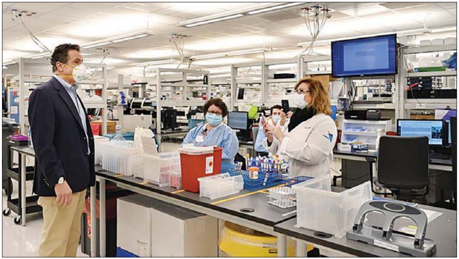
ကျန်းမာရေးစစ်ဆေးရေးစင်တာသို့ သွားရောက်သည့် နယူးယောက်အုပ်ချုပ်ရေးမှူး အန်ဒရူးကူမိုကို ဧပြီ ၁၉ ရက်က တွေ့ရစဉ်။

နယူးယောက် ဧပြီ ၂၀ အမေရိကန်နိုင်ငံ၏ အချို့သောပြည်နယ်များတွင် ပြည်သူများ၏အသွားအလာ ပိတ်ဆို့ကန့်သတ်မှုများကိုဖြေလျှော့ပေးရန် စီစဉ်လျက်ရှိပြီး အချို့သော ပြည်နယ်များတွင်မူ ပိတ်ဆို့ထားမှုများ ပြန်ပွင့်ပေးရန် တွန့်ဆုတ်နေကြသည်။ ဖလော်ရီဒါပြည်နယ်တွင် ကမ်းခြေအချို့နှင့် ပန်းခြံများကို ဧပြီ ၁၉ ရက်က အချိန်ကန့်သတ်ချက်ဖြင့် ပြန်ပွင့်ပေးခဲ့သည်။