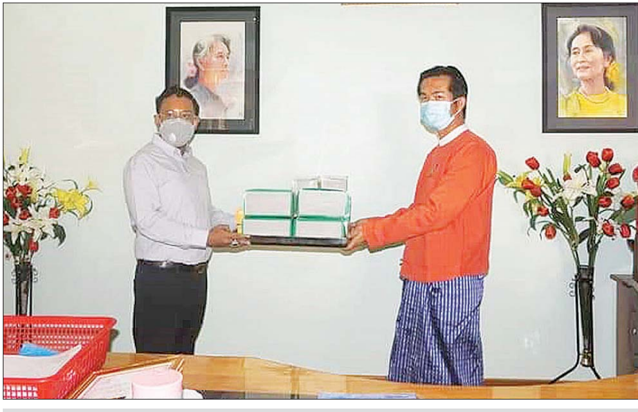
ပြည်နယ်ဝန်ကြီးချုပ် ဦးအယ်လ်ဖောင်းရှိ အလှူရှင်တစ်ဦးက ကိုဗစ်-၁၉ ရောဂါကာကွယ်ရေးပစ္စည်းများ ပေးအပ် လှူဒါန်းစဉ်။

လွိုင်ကော် ဧပြီ ၂၀ ကယားပြည်နယ်အတွင်း ကိုဗစ် -၁၉ ကာကွယ်၊ ကုသရေးလုပ်ငန်းများ ထိရောက် အောင်မြင်စွာ ပါဝင် ဆောင်ရွက်လျက်ရှိသည့် ဝန်ထမ်းများ၊ နေရပ်ပြန်များနှင့် စောင့်ကြည့်ခံရ သူများအတွက် နေ့စဉ်စားသောက်မှု အဆင်ပြေစေရန် စေတနာရှင်ပြည်သူ များက ယနေ့ နံနက်က ရောဂါ ကာကွယ်ရေးပစ္စည်းနှင့် စားသောက် ကုန်များ လှူဒါန်းရာ ပြည်နယ် ဝန်ကြီးချုပ် ဦးအယ်လ်ဖောင်းရှိ လက်ခံယူသည်။ အဆိုပါလှူဒါန်းမှုတွင် မမီး - ပြည့်ဝ ကြက်မွေးမြူရေးနှင့် ကြက်ဥ ဖြန့်ချိရေးလုပ်ငန်းက ကြက်ဥ အလုံး ၅၀၀၀၊ ပြည်နယ် ပညာရေးမိသားစု က လက်သန့်ဆေးရည် ၅၀၀ မီလီ လီတာဘူး ၆၀ နှင့် ၁၀၀၀ မီလီလီတာ ၁၄ဘူး၊ ရဲထွဋ်ကျော်သတ္တုတူးဖော်ရေး ကုမ္ပဏီလီမိတက်က နှာခေါင်းစည်း ၃၀၀၊ ရောဂါကာကွယ်ရေးဝတ်စုံ ၂၅၀၊ လက်အိတ် အစုံ ၅၀၀၊ မျက်မှန် အခုရေ ၈၀၊ သာမိုမိတာအခုရေ ၃၀၊ လက်သန့် ဆေးရည် ၅၀၀ မီလီလီတာဘူး ၁၀၀၊