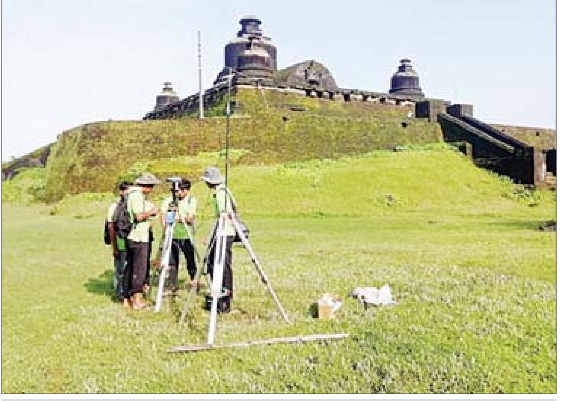
မြောက်ဦးယဉ်ကျေးမှု အမွေအနှစ်ဒေသအား ကမ္ဘာ့အမွေအနှစ်စာရင်း တင်သွင်းနိုင်ရေးအတွက် မြေမျက်နှာသွင်ပြင်မြေပုံထုတ်လုပ်ရန် RTK (Real Time Kinematic) နည်းဖြင့် GPS တိုင်းတာခြင်းဆောင်ရွက်စဉ်။

ဒီဖော်ပြချက်နဲ့အညီ စီးပွားရေး၊ လူမှုရေး၊ ဖွံ့ဖြိုးတိုးတက်ရေးနဲ့ သဘာဝပတ်ဝန်းကျင် အချက်ပြု (ဃ)သို့