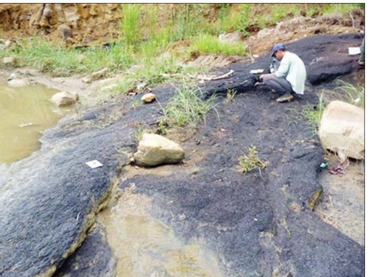
စစ်ကိုင်းတိုင်းဒေသကြီး၊ ပုလဲ၊ ကနီ၊ မင်းကင်းနှင့် မကွေးတိုင်းဒေသကြီး ထီးလင်း၊ ဂန့်ဂေါ ဒေသများတွင် ကျောက်စိမ်းသွေး ဆက်စပ်တိုင်းတာရေးလုပ်ငန်း ကွင်းဆင်းဆောင်ရွက်နေစဉ်။

အတွက် အလုပ်အကိုင်အခွင့်အလမ်းတွေရရှိစေဖို့၊ နိုင်ငံတော်နဲ့ ပြည်တွင်းကျောက်မျက်ရတနာလုပ်ငန်းရှင်တွေ စီးပွားရေး အကျိုးဖြစ်ထွန်းမှုတွေ ပိုမိုရရှိစေဖို့ ဆောင်ရွက်လျက်ရှိပါတယ်။