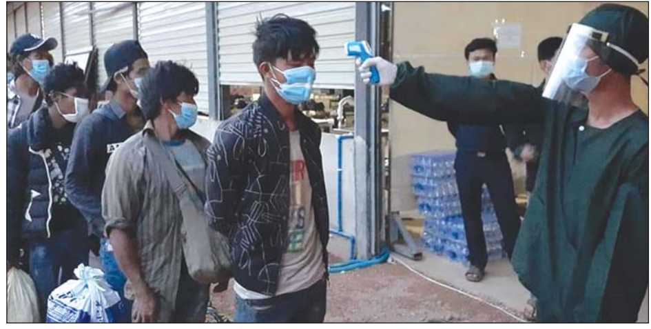
တရုတ်နိုင်ငံမှ ပြန်ဝင်လာသူများအား ကိုယ်အပူချိန်တိုင်းတာ စစ်ဆေးမှုများ ပြုလုပ်စဉ်။