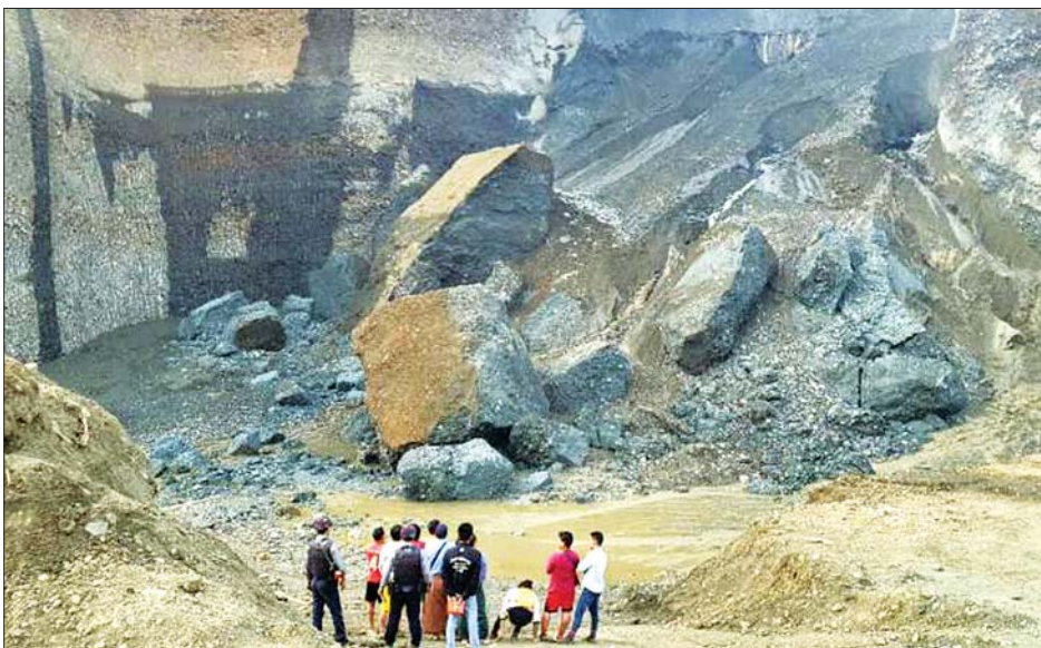
မြေစာပုံပြုကျပြီးနောက် ချောပျောက်ဆုံးနေသည့် ဘလောက်တူးဖော်ရေး ဧရိယာတွင် အသက် ၂၀ နှစ်ခန့်ရှိ အမျိုးသားတစ်ဦး၏ ရုပ်အလောင်းကို ရှာဖွေတူးဖော်ရရှိခဲ့သည်။

ဖြစ်စဉ်မှာ ယနေ့နံနက် ၅ နာရီခန့်က ဖားကန့်မြို့နယ် အေးမြသာယာအုပ်စု တောင်ပြိုကျေးရွာအနီးရှိ "ပိုင်မြို့သီဟ" ကျောက်မျက်ကုမ္ပဏီ၏ ရှေးကုမ္ပဏီလုပ်ကွက်တွင် အမြင့်ပေ ၃၀၀ ခန့်မှ အကျယ်ပေ ၁၀၀ ခန့်ရှိ မြေစာများပြုကျခဲ့၍ ရေမဆေးကျောက်ရှာဖွေသူ သုံးဦးခန့် မြေစာဖုံးလွှမ်းပျောက်ဆုံးကာ အသက် ၂၀ နှစ်ခန့်ရှိ အမျိုးသားတစ်ဦး၏ ရုပ်အလောင်းကို ရှာဖွေတူးဖော်ရရှိခဲ့သည်။