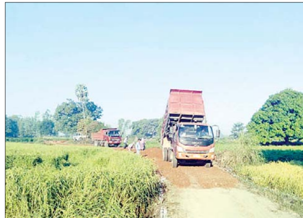
ဖောက်လုပ်နေဆဲ ကုန်ထုတ်လမ်းပိုင်းတစ်ခုခု

စလင်း ဧပြီ ၂၀ မကွေးတိုင်းဒေသကြီး စလင်းမြို့နယ် ကြက်သကိုင်ကျေးရွာတွင် ကျေးလက်နေထိုင်သူများ၏ လယ်ယာမြေ ကေဂဝဝ မှ လယ်ယာထွက်ကုန်များ ဈေးကွက်သို့အချိန်မီ ရောက်ရှိစေရေး ရည်ရွယ်ဖောက်လုပ်ခဲ့သည့် ကြက်သကိုင်ကျေးရွာ ကျေးလက်ကုန်ထုတ်လမ်းနှင့် ယင်းကုန်ထုတ်လမ်းပေါ်ရှိ တံတားနှစ်စင်းတည်ဆောက်မှုမှာ ရှာနှုန်းပြည့်ပြီးစီးနေပြီဖြစ်ကြောင်း မြို့နယ်ကျေးလက်ဒေသဖွံ့ဖြိုးတိုးတက်ရေးဦးစီးဌာနမှ သိရသည်။ အဆိုပါ ကုန်ထုတ်လမ်းမှာ လမ်းအရှည်ပေ ၃၉၆၀၊ အကျယ် ၁၂ ပေ ထု ၉ လက်မ မြေကောက်စရစ်လမ်းခင်းခြင်းနှင့် ယင်းကုန်ထုတ် လမ်းပေါ်ရှိ အရှည် ၁၈ ပေ၊ အကျယ် ၅ ပေ၊ အမြင့် ၆ ပေရှိ Box Culvert တံတားတစ်စင်း၊ အရှည် ၁၄ ပေ၊ အကျယ် ၉ ပေ၊ အမြင့် ၆ ပေရှိ Box Culvert တံတားတစ်စင်းတို့ကို မြို့နယ်ကျေးလက်ဒေသဖွံ့ဖြိုးတိုးတက်ရေးဦးစီးဌာနမှ ၂၀၁၉ - ၂၀၂၀ ဘဏ္ဍာနှစ်ခွင့်ပြုရန်ပုံငွေကျပ် ၁၉ ဒသမ ၆၂၄ သန်းဖြင့် တင်ဒါအောင်မြင်သော ကုမ္ပဏီမှ ၂၀၁၉ ခုနှစ် နိုဝင်ဘာလအတွင်းက စတင်ဆောင်ရွက်ခဲ့ပြီး ယခုအခါ ရှာနှုန်းပြည့်ပြီးစီးပြီဖြစ်ကြောင်း မြို့နယ်ကျေးလက်ဒေသဖွံ့ဖြိုးတိုးတက်ရေးဦးစီးဌာန မြို့နယ်ဦးစီးမှူး ဦးကျော်ဇေယျက ပြောသည်။ (ငြိမ်းသူ(စလင်း))