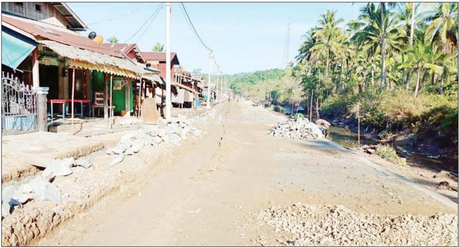
ကရသူရိမြို့ ဒေသဖွံ့ဖြိုးရေးဆောင်ရွက်လျက်ရှိသော ကွန်ကရစ်လမ်းခင်းခြင်းတစ်နေရာ

ကရသူရိ ဧပြီ ၂၀ တနင်္သာရီတိုင်းဒေသကြီး ဘုတ်ပြင်း မြို့နယ် ကရသူရိမြို့ မြို့ပေါ် ရပ်ကွက်သုံးနေရာ၌ ၂၀၁၉-၂၀၂၀ ဘဏ္ဍာနှစ် တိုင်းဒေသကြီးအစိုးရ အဖွဲ့ရန်ပုံငွေကျပ် ၁၀၆၉ သိန်းဖြင့် ဒုတိယသုံးလပတ် လုပ်ငန်းများ ဆောင်ရွက်လျက်ရှိသည်။