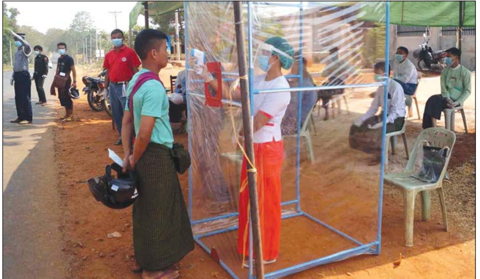
ဆီဆိုင်မြို့အဝင်ဂိတ်၌ ကျန်းမာရေးစစ်ဆေးမှုများ ဆောင်ရွက်ပေးနေစဉ်

လက်ကမ်းစာစောင်များ ဖြန့်ဝေခြင်း စသည့် ရောဂါကာကွယ်ရေးလုပ်ငန်းနှင့် အသိပညာပေးခြင်း လုပ်ငန်းများကို ဆောင်ရွက်ပေးနေခြင်း ဖြစ်ကြောင်း သိရသည်။ ခွန်ရဲထွေး(ဆီဆိုင်)