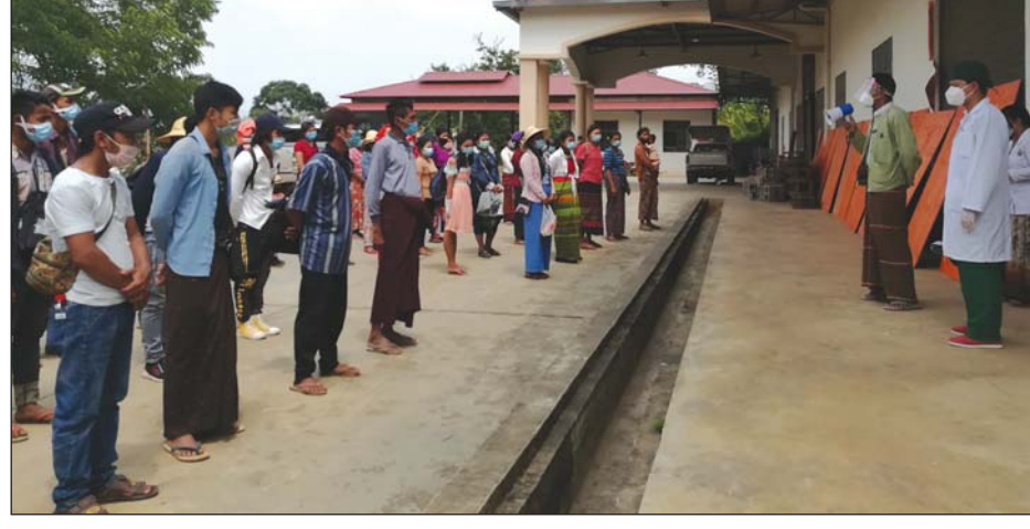
တရုတ်နိုင်ငံမှ ပြန်ဝင်လာသူများအား သတ်မှတ်စည်းကမ်းများကို လိုက်နာရန် မှာကြားနေစဉ်