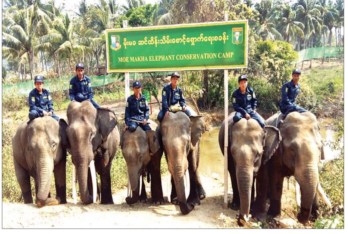
ဆင်ထိန်းသိမ်းစောင့်ရှောက်ရေးအခြေပြုခရီးသွားလုပ်ငန်း ဆောင်ရွက်နေသည့် မိုးမဆင်ထိန်းသိမ်းစောင့်ရှောက်ရေးစခန်း။

ဖြေ။ ။ ကျောက်မျက်ရတနာ ကဏ္ဍကို ဥပဒေအရ တိုင်းဒေသကြီး/ ပြည်နယ်အစိုးရ အဖွဲ့တွေက ကျောက်မျက်ရတနာ အသေးစား၊ လက်လုပ်လက်စားလုပ်ငန်းတွေကို စီမံခန့်ခွဲနိုင်မှာဖြစ်ပါတယ်။ ကောင်းမွန်တဲ့ စီမံခန့်ခွဲမှု ရရှိနိုင်စေဖို့အတွက် တိုင်းဒေသကြီး/ပြည်နယ် အစိုးရအဖွဲ့တွေမှ သတ္တုနဲ့ သယံဇာတဆိုင်ရာ ဝန်ကြီးတွေ၊ ပြည်ထောင်စုဝန်ကြီးဌာနနဲ့ လုပ်ငန်းညှိနှိုင်းအစည်းအဝေးတွေ ပြုလုပ်ပြီး ပေါင်းစပ်ညှိနှိုင်း ဆောင်ရွက်လျက်ရှိပါတယ်။ ။