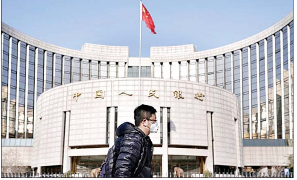
နာခေါင်းစည်းတပ်ဆင်ထားသည့် ပြည်သူတစ်ဦး တရုတ်ဗဟိုဘဏ်ရှေ့ ဖြတ်လျှောက်နေစဉ်။

ပေကျင်း ဧပြီ ၂၀ တရုတ်နိုင်ငံအတွင်း ကိုဗစ်-၁၉ ဖြစ်ပွားမှု၏ နောက်ဆက်တွဲအနေဖြင့် စီးပွားရေးလုပ်ငန်းများ အဆင်ပြေချောမွေ့စေရန် တရုတ် ဗဟိုဘဏ်က အတိုးနှုန်းကို ၀ ဒသမ ၂ ရာခိုင်နှုန်း လျှော့ချပေးလိုက်ကြောင်း သိရသည်။ ဖော်ပြပါ အတိုးနှုန်းလျှော့ချမှုသည် အခက်အခဲ ဖြစ်ပေါ်ခဲ့သည့် စီးပွားရေးလုပ်ငန်းများကို အကူအညီပေးရန် တရုတ်အာဏာပိုင်များက လုပ်ဆောင်ခဲ့သည့် အစီအစဉ်တစ်ခု ဖြစ်သည်။ ယခုလအတွက် ချေးငွေအတိုးနှုန်းမှာ ၃ ဒသမ ၈၅ ရာခိုင်နှုန်း ဖြစ်ကြောင်း တရုတ်ဗဟိုဘဏ်က ကြေညာခဲ့သည်။ ယင်းသို့ အတိုးနှုန်းလျှော့ချမှုသည် နှစ်လအတွင်း ပထမအကြိမ်လျှော့ချမှုဖြစ်သည်။ တရုတ်နိုင်ငံ၏စီးပွားရေးသည် ပြီးခဲ့သည့် ဇန်နဝါရီလမှ မတ်လအထိ အချိန်အတွင်း ၆ ဒသမ ၈ ရာခိုင်နှုန်း