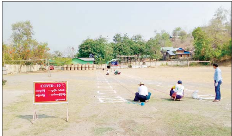
စေတုတ္တရာမြို့၌ ယာယီဈေးဖွင့်လှစ်ပေးရန် အကွက်ချသတ်မှတ်ပေးနေစဉ်။