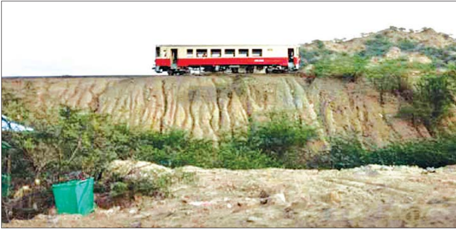
ပခုက္ကူမြို့မှ အခြားမြို့များသို့ ဆက်သွယ်ပြေးဆွဲပေးသော ခရီးစဉ်တစ်ခုကို တွေ့ရစဉ်။

ပခုက္ကူ ဧပြီ ၂၀ ပခုက္ကူမြို့ မြန်မာ့မီးရထား ပခုက္ကူ ဘူတာမှ အခြေစိုက်ပြေးဆွဲနေသည့် လမ်းကြောင်း လေးခုကို ဧပြီ ၃၀ ရက်အထိ ပြေးဆွဲခြင်း ရပ်နားထားမည်ဖြစ်သည်။ ပခုက္ကူမြို့မှ မုံရွာ၊ ဆိပ်ဖြူ၊ ကျော၊ တန့်ကြည်တောင် ဘူတာများသို့ ပြေးဆွဲနေသည့် ရထားခရီးစဉ်များကို ဧပြီ ၃၀ ရက်မှ ၁၉ ရက်အထိ ရပ်နားကြောင်း တရားဝင်ကြေညာထားခဲ့ပြီး ယခုအခါ ခရီးသွားပြည်သူများအား ကိုဗစ် - ၁၉ ကြိုတင်ကာကွယ်နိုင်ရေးနှင့် ကူးစက်ပြန့်ပွားမှုမရှိစေရေးအတွက် ဧပြီ ၃၀ ရက်အထိ ရပ်နားရက် တိုးမြှင့်သတ်မှတ်ခြင်း ဖြစ်ကြောင်း ပခုက္ကူဘူတာရုံပိုင်ကြီး၏