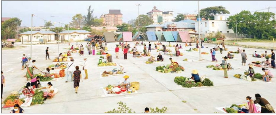
ညောင်ရွှေမြို့ရှိ ယာယီဈေးဖွင့်လှစ်ပေးချက်ပေးစာတို့ တွေ့ရစဉ်။

ကိုဗစ်-၁၉ ရောဂါ ကြိုတင်ကာကွယ် ထိန်းချုပ်ရေး ကာလအတွင်း ဈေးဝယ်သူများနှင့် ဈေးရောင်းသူများ တစ်ဦးနှင့်တစ်ဦး နီးကပ်စွာဝယ်ယူမှုမရှိစေရန်အတွက် ညောင်ရွှေမြို့ လွတ်လပ်ရေးကျောက်တိုင်ကွင်း၌ ယာယီဈေးအဖြစ် မြို့နယ်စည်ပင်သာယာရေးကော်မတီ၏ စီစဉ်ကြီးကြပ်မှုဖြင့် နေ့စဉ် နံနက် ၆ နာရီခွဲမှ ၁၀ နာရီအထိ ဖွင့်လှစ်ပေးလျက်ရှိသည်။