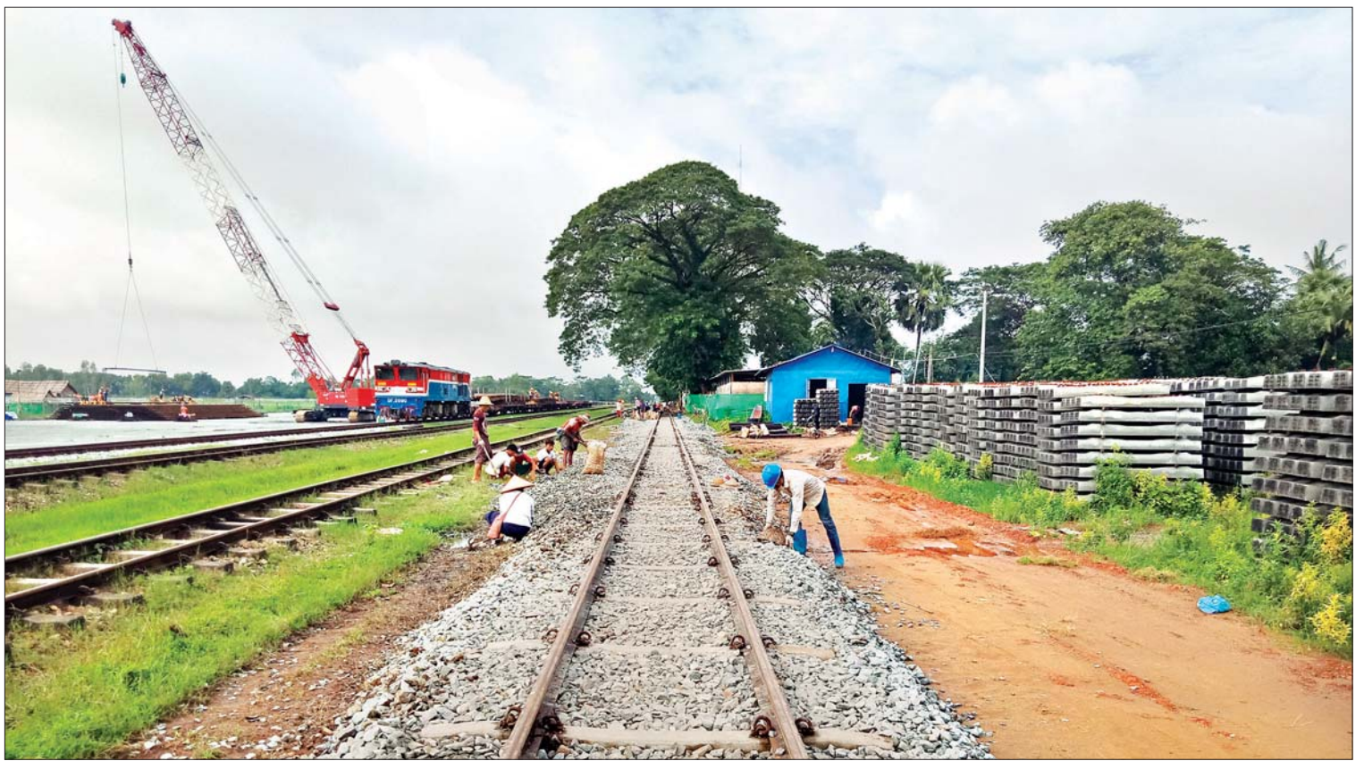
ရထားသံလမ်းများ ပြုပြင်ထိန်းသိမ်းရေးလုပ်ငန်းခွင်တစ်ခု။

အစိုးရအဖွဲ့အစည်းနဲ့ ဝန်ကြီးဌာန စုစုပေါင်း ၄၅ ခုက သတင်းအချက်အလက် စုစုပေါင်း ၁၁၀၀၀ ကျော်ကို လွှင့်တင်ထားပါတယ်။ ဆက်လက်ပြီး Application Program Interface (API) ပိုပြီး ချိတ်ဆက်လာနိုင်အောင်