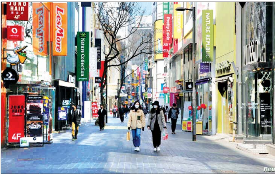
ဆိုးလ်မြို့တွင် နှာခေါင်းစည်းတပ်ဆင်ကာ သွားလာနေကြသူများကို မတ် ၂၃ ရက်က တွေ့ရစဉ်။

တောင်ကိုရီးယားတွင် ယခု အချိန်အထိ ကူးစက်ခံရသူ ၁၀၆၆၁ ဦးရှိပြီး ၂၄၄ ဦး သေဆုံးခဲ့ပြီးဖြစ်သည်။ ဖေဖော်ဝါရီလနှောင်းပိုင်းမှ စတင်ကာ နေ့စဉ် ကူးစက်ခံရမှုပေါင်း ၉၀၀ နီးပါး တွေ့ကြုံခဲ့ရသည်။ သို့သော် ကူးစက်ခံရမှုနှုန်းမှာ တဖြည်းဖြည်း ကျဆင်းခဲ့ပြီး လွန်ခဲ့သည့်နှစ်ပတ် အတွင်းနှစ်ဆနီးပါး ကျဆင်းခဲ့သည်။ ပြီးခဲ့သည့် သီတင်းပတ်က ကျင်းပခဲ့ သည့် တောင်ကိုရီးယား အထွေထွေ ရွေးကောက်ပွဲတွင် အာဏာရပါတီက အနိုင်ရခဲ့ပြီး ပြည်သူ့အများစုသည် သမ္မတမွန်ဂျေအင်း အစိုးရအဖွဲ့၏ ကိုဗစ်-၁၉ နှိမ်နင်းရေးအပေါ် ထောက်ခံခဲ့ကြသည်။ သို့သော်