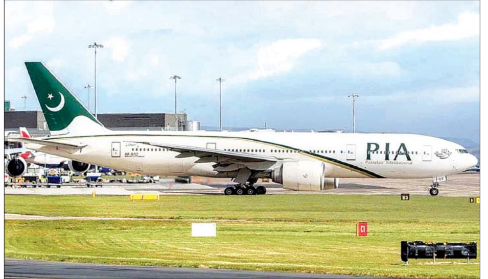
ပါကစ္စတန်အပြည်ပြည်ဆိုင်ရာလေကြောင်းလိုင်းမှ လေယာဉ်တစ်စင်းကို တွေ့ရစဉ်။