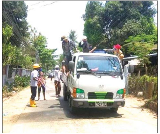
အင်းစိန်မြို့နယ် ကွက်သစ်ရပ်ကွက်၌ ပိုးသတ်ဆေးဖျန်း