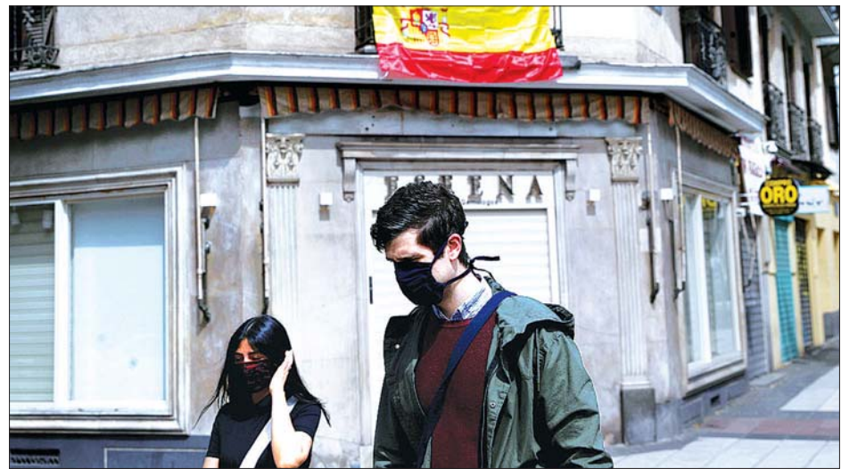
စပိန်နိုင်ငံ မက်ဒရစ်မြို့တွင် သွားလာလှုပ်ရှားနေကြသူများကို ဧပြီ ၁၈ ရက်က တွေ့ရစဉ်။

ဧပြီ ၂၀ ရက်မှစတင်ကာ ယင်း အမိန့် စတင်အသက်ဝင်လာမည်ဟု ပင်တဂွန်မှ အရာရှိတစ်ဦးပြောခဲ့ သူ မက်သယူး ဒိုနိုဗန်က ပြောသည်။ အမေရိကန် တပ်ဖွဲ့အတွင်း ကိုဗစ်-၁၉ ကူးစက်ခံရမှု ထိန်းချုပ်ရေးအတွက် ကာကွယ်ရေးဝန်ကြီး အက်စပါက လွန်ခဲ့သည့်လအတွင်းက နိုင်ငံရပ်ခြား ရှိ အမေရိကန်တပ်ဖွဲ့ဝင်များ၏ လှုပ်ရှားမှုများကို ရက်ပေါင်း ၆၀ ကြာ ရပ်နားထားမည်ဖြစ်ကြောင်း ကြေညာ ခဲ့သည်။ ဆင်ဟွာ