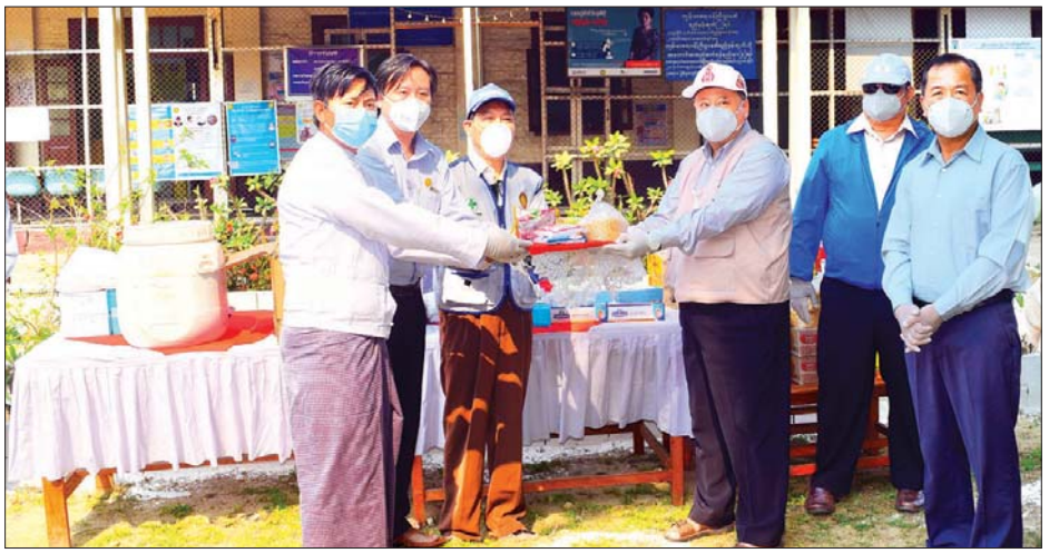
ပြည်နယ်ဝန်ကြီးချုပ် ဒေါက်တာလင်းထွဋ် ထောက်ပံ့ပစ္စည်းများ ပေးအပ်စဉ်။

အထောက်အကူပြုပစ္စည်းများဖြစ်သည့် ရောဂါကာကွယ် ရေးဝတ်စုံ ၃၀၀၊ လက်အိတ်ရှည် ၁၀၀၀၊ နှာခေါင်းစည်း ၁၀၀၀၊ မျက်မှန် ၁၂ ခုနှင့် လုပ်ငန်းသုံးပစ္စည်းများ၊ အခြေခံ စားသောက်ကုန်များနှင့် ထောက်ပံ့ငွေကျပ် ငါးသိန်းတို့ကို ပေးအပ်လှူဒါန်းရာ သွားဘက်ဆိုင်ရာ ဆရာဝန် ဒေါက်တာ သိန်းဦးနှင့် ဝန်ထမ်းများက လက်ခံယူခဲ့သည်။ ထို့နောက် ဝန်ကြီးချုပ်နှင့် ပြည်နယ်ဝန်ကြီးများက ကျန်းမာရေး ဝန်ထမ်းများကို အားပေးစကားများ ပြောကြားခဲ့ကြောင်း သိရသည်။ သန်းထွန်းအေး (ပြန်/ဆက်)