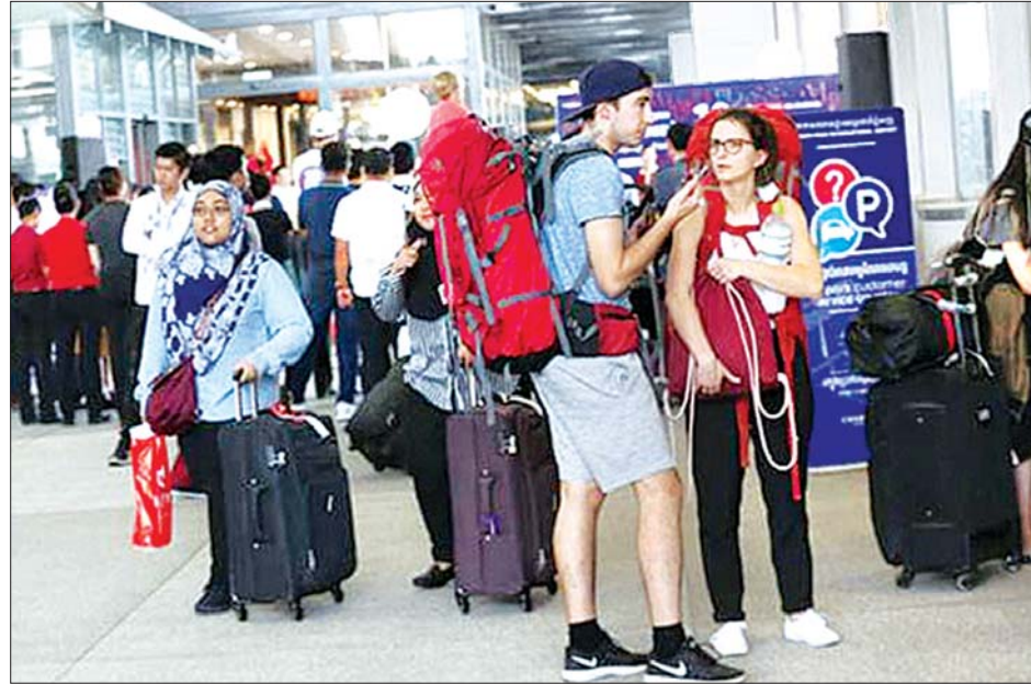
လေကြောင်းခရီးစဉ်ရပ်နားမှုများမပြုမီ ကမ္ဘောဒီးယားနိုင်ငံရှိ လေဆိပ်တစ်ခု၌ ပြည်ပခရီးသွားပြည်သူအချို့ကို တွေ့ရစဉ်။

လာအိုနိုင်ငံရှိ ဆေးရုံတစ်ရုံ၌ ကိုဗစ်-၁၉ တိုက်ဖျက်ရေးနှင့် ကုသရေး ဆောင်ရွက်မှုတွင် ပါဝင်ကူညီ ဆောင်ရွက်နေသည့် တရုတ်ဆေးဘက်ပညာရှင်အဖွဲ့ကို တွေ့ရစဉ်။