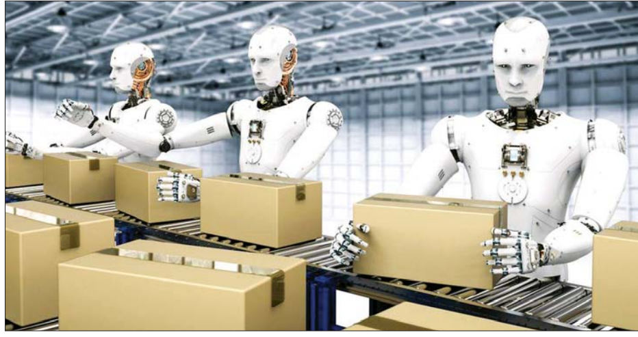
လုပ်ငန်းခွင်တစ်ခု၌ စက်ရုပ်များကို အသုံးပြုနေစဉ်။

အရှိန်မြန်လာစေ လူသားအလုပ်သမားတွေလုပ်ကိုင်ရမယ့် လုပ်ငန်းခွင်တွေမှာ စက်ရုပ်တွေကို အစားထိုးသုံးစွဲတော့မယ့် အစီအစဉ်ဟာ ပိုကောင်းဖို့ဖြစ်လာနိုင်သလို ပိုဆိုးဖို့လည်းဖြစ်ရင်ဖြစ်လာနိုင်တယ်လို့ ကျွမ်းကျင်သူတွေက ဆိုကြပါတယ်။ ကိုဗစ်-၁၉ ကပ်ရောဂါပျံ့နှံ့မှုက လူသားတွေနေရာမှာ စက်ရုပ်တွေအစားထိုးဖို့ ပြင်ဆင်နေတဲ့ ဖြစ်စဉ်တွေကို ပိုပြီးအရှိန်မြန်လာစေခဲ့တယ်လို့ ၎င်းတို့က ထောက်ပြခဲ့ကြပါတယ်။