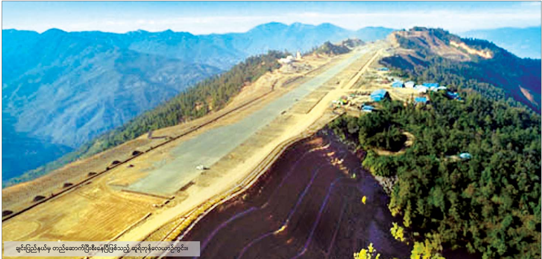
ချင်းပြည်နယ်မှ တည်ဆောက်ပြီးစီးနေပြီဖြစ်သည့် ဆူရ်ဘန်လေယာဉ်ကွင်း။

“ကျွန်တော်တို့နိုင်ငံမှာ အသုံးပြုနေတဲ့ လေဆိပ် ၃၄ ခုရှိပါတယ်။ လေဆိပ် ၃၄ ခုထဲမှာ ပြည်တွင်းလေဆိပ် ၃၀ ၊ နိုင်ငံတကာလေဆိပ်က သုံးခု၊ အခုဆိုရင် Custom, Aerodrome လို့ ခေါ်တဲ့ နိုင်ငံတကာကနေ စင်းလုံးငှားလေယာဉ်(Chartered Flight)တွေ တိုက်ရိုက်ဆင်းသက်နိုင်တဲ့ ညောင်ဦးလေဆိပ်တို့အပါအဝင် ဖြစ်ပါတယ်။ လေဆိပ်အဟောင်းတွေက ၃၅ ခုရှိပါတယ်။ အားလုံးပေါင်း ၆၉ ခုရှိပါတယ်။ လေကြောင်းသွားလာ မှုက ၂၀၁၆ ခုနှစ်မှာ လူဦးရေ ၉၂၀၀၀၀၀ လောက် အသုံးပြုခဲ့ပြီး ၂၀၁၉ ခုနှစ်မှာ ခရီးသည်စုစုပေါင်း ၁၁၂၀၀၀၀ အထိ အသုံးပြုခဲ့လို့ နှစ်သန်းကျော်တိုးမြှင့်လာတာကို မြင်တွေ့ရမှာဖြစ်ပါတယ်”