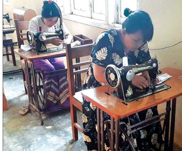
ကျော်မြိုင် (ပြန်/ဆက်)

ဝန်းသို ဧပြီ ၁၉ စစ်ကိုင်းတိုင်းဒေသကြီး ဝန်းသိုမြို့နယ် ကျေးလက်ဒေသဖွံ့ဖြိုးတိုးတက်ရေး ဦးစီးဌာနမှူးချုပ် ကိုဗစ်-၁၉ ရောဂါကာကွယ် ထိန်းချုပ်ကုသရေးလုပ်ငန်းများတွင် အထောက်အကူဖြစ်စေရန်အတွက် စေတနာရှင် အလှူရှင်များပူးပေါင်း၍ ယမန်နေ့မှစတင်ပြီး နှာခေါင်းစည်းများပြုလုပ်လျက်ရှိသည်။ (အောက်ပုံ)