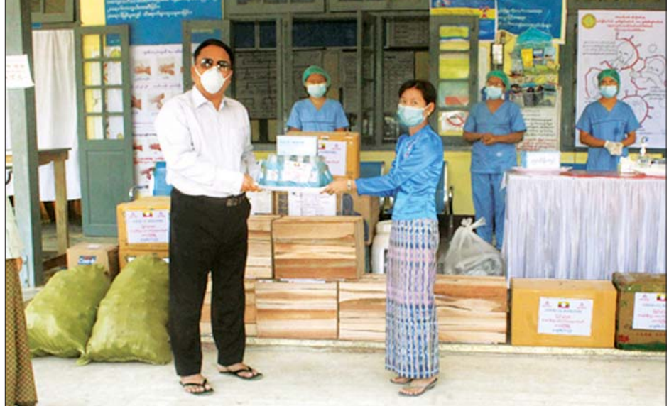
မောက်မယ်မြို့နယ်၌ ကိုဗစ် -၁၉ ရောဂါကြိုတင်ကာကွယ်ရေးအတွက် အလှူငွေနှင့် ပစ္စည်းများ လှူဒါန်းစဉ်။