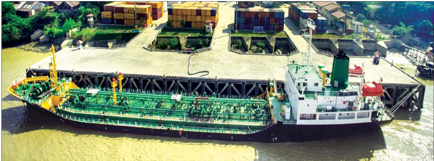
Kyimyindaing International Port Terminal ဆိပ်ခံတံတား။

မိုးလေဝသစခန်းနှင့် ဆက်သွယ်ရေး ဝန်ကြီးဌာနမှာ ဌာနပေါင်း ၁၈ ခုရှိပြီး ပြည်သူလူထုကို တိုက်ရိုက်ဝန်ဆောင်မှုပေးတဲ့ လုပ်ငန်းတွေအကြောင်းကို ကျွန်တော်အထက်မှာ ပြောကြားခဲ့တာ ဖြစ်ပါတယ်။ ဒါတွေက ကျွန်တော်တို့ ဝန်ကြီးဌာနရဲ့ ဆောင်ရွက်ချက်တွေအထဲက အနည်းငယ် အကျဉ်းချုပ်မျှသာဖြစ်ပါတယ်။ ဗဟိုပို့ဆောင်ဆက်သွယ်ရေး သင်တန်းကျောင်း၊ ရေကြောင်းပညာတက္ကသိုလ်နဲ့ ကုန်သွယ်ရေးကြောင်းကောလိပ် စတဲ့ဌာနအသီးသီးကနေ သင်တန်းတွေ ပိုမိုဖွင့်လှစ်ပြီး လူ့စွမ်းအားအရင်းအမြစ်တွေ ထုတ်ဖော်တာတွေရှိပါတယ်။ ဒါတင်မက အခြားသောဌာနတွေလည်း အများအပြားရှိပါတယ်။ အားလုံးက သက်ဆိုင်ရာကဏ္ဍအလိုက် လုပ်ငန်းရည်မှန်းချက်တွေကို ပြည့်မီအောင် အင်တိုက်အားတိုက် ဆောင်ရွက်နေကြတာ ဖြစ်ပါတယ်။ နောက်ထပ်ဆောင်ရွက်ရမယ့် လုပ်ငန်းတွေ အများကြီးရှိပါတယ်ဆိုတာကို ပြောကြားလိုပါတယ်ခင်ဗျာ။ ။