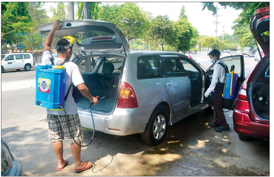
ရာ နေရာများရှိ အငှားယာဉ်ကိုင်များတွင်လည်း ပိုးသတ်ဆေးဖျန်းခြင်း လုပ်ငန်းများကို ဆောင်ရွက်လျက်ရှိသည်။ အလားတူ လူမှုရေးအသင်းအဖွဲ့များကလည်း ရန်ကုန်မြို့ရှိ ရပ်ကွက်များအတွင်းရှိ လမ်းများ၌ ပိုးသတ်ဆေးဖျန်းခြင်းနှင့် ထုံးဖြူးခြင်းလုပ်ငန်းများကို ဆောင်ရွက်လျက်ရှိကြောင်း သိရသည်။

မော်တော်ယာဉ်မောင်းနှင်သူများ၊ လိုက်ပါစီးနင်းသူများနှင့် ၎င်းတို့၏ မိသားစုဝင်များအပါအဝင် ပြည်သူများအားလုံး ကိုဗစ်-၁၉ ရောဂါဖြစ်ပွားမှုမှ ကင်းဝေးစေရန်နှင့် လက်ရှိဖြစ်ပွားနေသော ကိုဗစ်-၁၉ ရောဂါကို ကာကွယ်ထိန်းချုပ်နိုင်ရန်ရည်ရွယ်ကာ ထိုသို့ဆောင်ရွက်ခြင်းဖြစ်ပြီး ၎င်းတို့အနေဖြင့် ရန်ကုန်မြို့ လေဆိပ်၊ ရေဆိပ်နှင့် ရန်ကုန်ဘူတာကြီးတို့ရှိ အငှားယာဉ်ကိုင်များအပါအဝင် လူစည်ကား