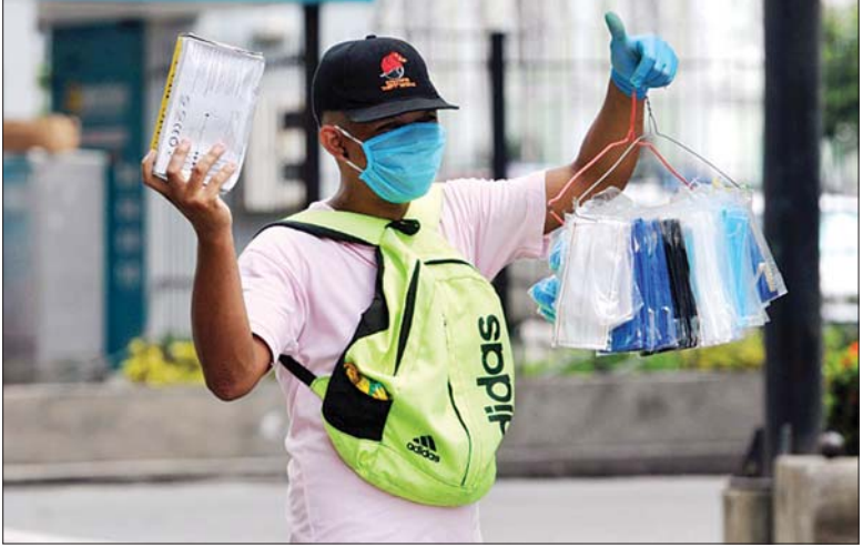
အီကွေဒေါနိုင်ငံတွင် ကိုဗစ်-၁၉ ကူးစက်ပျံ့နှံ့မှုကိုကာကွယ်ရန် နှာခေါင်းစည်းများလိုက်လံ ရောင်းချနေသော လက်ပွေ့ဈေးသည်တစ်ဦးကို တွေ့ရစဉ်။

ဝါရှင်တန် ဧပြီ ၁၈ ကိုဗစ်-၁၉ ကြောင့် ကမ္ဘာတစ်ဝန်းသေဆုံးမှုသည် လွန်ခဲ့သော ၂၄ နာရီက ၁၅၀၀၀၀ ကျော်လွန်ခဲ့သည်။ ကမ္ဘာ့ကပ်ရောဂါစတင်ဖြစ်ပွားရာ ဗဟိုချက်နေရာဖြစ်သည့် ဂူဟာနီနှင့် ပတ်သက်သည့် ကိုဗစ်-၁၉ ကိန်းဂဏန်းကို တရုတ်က ပြန်လည်ပြင်ဆင်လိုက်ပြီးနောက် အမေရိကန်သမ္မတ ဒေါ်နယ် ထရမ်က တရုတ်နိုင်ငံအား တကယ့်စာရင်းမှန်ကို ဆက်လက်ဖုံးကွယ်ထားသည်ဆိုပြီး စွပ်စွဲခဲ့သည်။