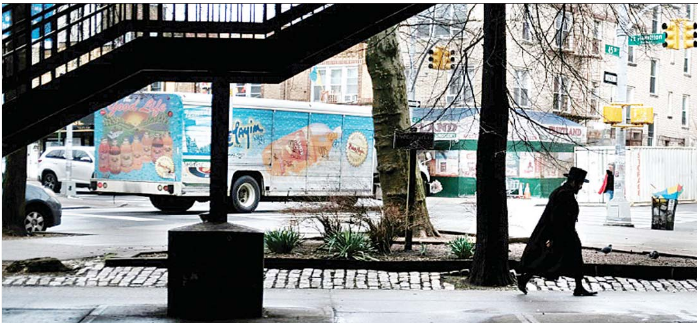
နယူးယောက်မြို့၊ ဘရူတ်ကလင်း လမ်းမတစ်နေရာကို တွေ့ရစဉ်။

အခုဆိုရင် အိမ်ငှားခ ၈၃၃ ဒေါ်လာမပေးရဖို့အရေး သူကြိုးစားနေပါတယ်။ လွန်ခဲ့တဲ့လကစလို့ အမေရိကန် ၂၂ သန်းဟာ အလုပ်လက်မဲ့ဖြစ်သွားပါတယ်။ စတိုးဆိုင် တွေ၊ စားသောက်ဆိုင်တွေ အခြားသောအရေးကြီးဘူးဟု ယူဆရတဲ့လုပ်ငန်းတွေအားလုံးကို ရပ်နားထားဖို့ ဖိအား ပေးခဲ့ပါတယ်။ အဲဒီအတွက်ကြောင့် အလုပ်သမား အင်အားကို လျော့ချလိုက်ရပါတယ်။ ကိုဗစ် -၁၉ ပျံ့နှံ့မှုကို ကာကွယ်နိုင်ရေးအတွက် မလိုအပ်တဲ့လှုပ်ရှားမှုအား လုံးကို ပိတ်ပစ်လိုက်ရပါတယ်။ ကိုဗစ် -၁၉ ကြောင့် အမေရိကန်နိုင်ငံအတွင်း လူအများစုဟာ အကြွေးတွေနဲ့