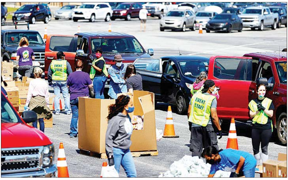
ကျော်ဂျီယာရှိ ရွှေ့ပြောင်းဈေးတစ်ခုတွင် စေတနာရှင်များ ကုန်ပစ္စည်းများကို ကားအတွင်းထည့်နေသည်ကိုတွေ့ရစဉ်။

ကိုဗစ်- ၁၉ ဖြစ်စဉ်ကြောင့် မမျှော်မှန်းနိုင်သော ဆုံးရှုံးမှုများဖြစ်