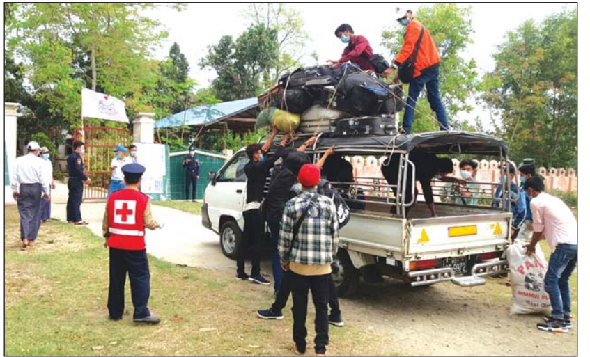
မိုးညှင်းမြို့သို့ တရုတ်နိုင်ငံမှ ပြန်လည်ရောက်ရှိလာသူများ

ဧပြီ ၁၇ ရက်တွင် မြို့နယ်အတွင်းရှိ ကန့်သတ် စောင့်ကြည့်စခန်းများ၌ နယ်စပ်စစ်ဆေးရေးဂိတ်မှ မြို့နယ်အတွင်းသို့ ဝင်ရောက်လာသူပေါင်း ၆၂ ဦး ရှိပြီး ၎င်းတို့နှင့်သက်ဆိုင်သည့် ကန့်သတ်စောင့် ကြည့်စခန်းများ၌ မှတ်တမ်းယူ လက်ခံ၍ စောင့် ကြည့်ခြင်းများကို ဆောင်ရွက်ခဲ့ကြောင်း၊ နန်း ခမ်း သာယာကုန်း အခြေခံပညာအထက်တန်း ကျောင်းခွဲ၌ ဖွင့်လှစ်ထားရှိသည့် ကန့်သတ်စောင့် ကြည့်ရေးစခန်းတွင် ၁၆ ဦး၊ လက်ပံတန်းကျေးရွာ စခန်း၌ တစ်ဦး၊ ဆန္ဒကုန်းအင်းသာကျေးရွာ စခန်း တွင် တစ်ဦး၊ ဟိုပင်မြို့တွင် သုံးဦး၊ ကြာကြီးကွင်း ကျေးရွာ စခန်းတွင် ၃၉ ဦးနှင့် ထုံးရေပေါက်ကျေးရွာ စခန်းတွင် နှစ်ဦးဖြစ်ကြောင်း၊ သက်ဆိုင်ရာ ကန့် သတ်စောင့်ကြည့်ရေးစခန်းများ၌ ၎င်းတို့အား ကိုယ် အပူချိန်တိုင်းတာ စစ်ဆေးခြင်းနှင့် ကိုယ်ရေးအချက်