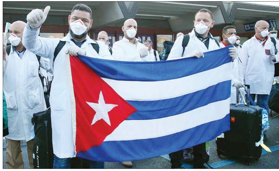
အီတလီနိုင်ငံသို့ ရောက်ရှိလာသည့် ကျူးဘားဆရာဝန်များကို တွေ့ရစဉ်။

ဟာဗားနား ဧပြီ ၁၈ ကျူးဘားနိုင်ငံမှ ကျန်းမာရေးဝန်ထမ်း ၁၀၀ နီးပါးခန့်မှာ ကိုဗစ်-၁၉ ကူးစက်ခံထားရကြောင်း ကျန်းမာရေးဝန်ကြီးဂျီဆေးအိန်ဂျယ်ပေါတယ် မရင်ဒါက ဧပြီ ၁၇ ရက်တွင် ပြောကြားခဲ့သည်။ ကိုဗစ် -၁၉ ကူးစက်ခံထားရသည့် ကျန်းမာရေးဝန်ထမ်းများတွင် ဆရာဝန် ၄၇ ဦး၊ သူနာပြု ၃၀၊ ကျန်းမာရေးနည်းပညာရှင်လေးဦး၊ ဆေးကျောင်းသားငါးဦး၊ အခြား