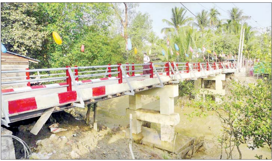
ဒလမြို့နယ် သက်ကယ်ကွင်းကျေးရွာ၌ ဆောက်လုပ်ပြီးစီးခဲ့သော ချောင်းကူးတံတားသစ်ကို တွေ့ရစဉ်။