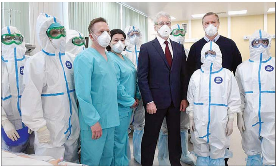
ကူးစက်ရောဂါကုသရေး ဆေးရုံသစ်ဖွင့်ပွဲသို့ တက်ရောက်လာသည့် မော်စကိုမြို့တော်ဝန် ဆာဂီဆော့ဘရာနင်(အလယ်) ကို ဧပြီ ၁၇ ရက်က တွေ့ရစဉ်။

ဆက်လက်ပြောကြားခဲ့သည်။ ရုရှားနိုင်ငံတွင် ဇန်နဝါရီ ၃၁ ရက်က ကိုဗစ်-၁၉ ကူးစက်ခံရသူကို ပထမဆုံးတွေ့ရှိခဲ့ပြီး မတ်လ ကုန်ခါနီးတွင် ကူးစက်ခံရသူအရေအတွက်မှာ သိသိသာသာ မြင့်တက်လာခဲ့သည်။ ဧပြီ ၉ ရက်တွင် ကူးစက်ခံရသူ ၁၀၀၀၀ အထိရှိခဲ့ပြီး ဧပြီ ၁၄ ရက်တွင် ၂၀၀၀၀ အထိ မြင့်တက်လာခဲ့ကြောင်း သိရသည်။ ဧပြီလ ၁၁ ရက်မှစတင်ကာ တရုတ်နိုင်ငံမှ ဆေးအဖွဲ့သည် ကိုဗစ်-၁၉ တိုက်ဖျက်ရေးအတွက် ရုရှားအဖွဲ့နှင့်အတူ ပူးပေါင်းဆောင်ရွက်ခဲ့သည်။ ဆင်ယွာ