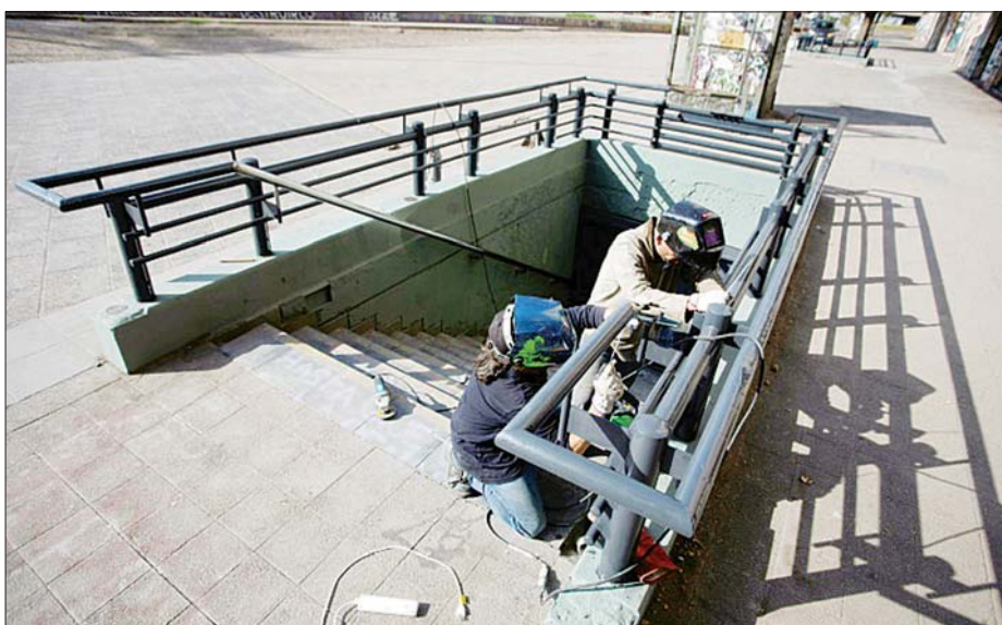
ချိုလီတွင် ဆန္ဒထုတ်ဖော်သူများက ဖျက်ဆီးခဲ့သော မြေအောက်ဘူတာရုံဝင်ပေါက်တစ်ခုခုကို ပြန်လည်ပြင်ဆင်နေစဉ်။