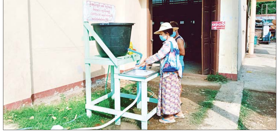
ရွှေကူမြို့ ပျံကျဈေးအဝင်နေရာ၌ လက်ဆေးရန် ဆောင်ရွက်ပေးထားစဉ်။

မည်ဆိုပါက လက်ဆေးရန်၊ စက်ဘီးဆိုင်ကယ်၊ ကားများဖြင့် ယာယီပျံကျဈေးသို့ ဝင်ရောက်ခြင်းမပြုစေဘဲ သတ်မှတ်နေရာတွင် အပ်နှံထားရှိစေခြင်း၊ အသား၊ ငါး ရောင်းချသည့် ဈေးသည်များ လက်အိတ်၊ နှာခေါင်းစည်း၊ ရင်ကာများ ဝတ်ဆင်ထားရှိစေခြင်း၊ ဈေးရောင်းချသည့် ဈေးသည်များ မိမိရောင်းချသည့်နေရာအား သန့်ရှင်းအောင် ဆောင်ရွက်ရန်နှင့် အမှိုက်များကို သတ်မှတ်ထားသည့် အမှိုက်ပုံးထဲသို့ စွန့်ပစ်စေခြင်း၊ ယာယီပျံကျဈေးချိန်ကို နံနက် ၅ နာရီမှ မွန်းတည့် ၁၂ နာရီအထိ ကျန်းမာရေး အသိအမြင်ဖြင့် သတ်မှတ်နေရာများ ချထားကာ ဖွင့် လှစ်ရောင်းချစေပြီး ညနေဈေးများအား ဖွင့်လှစ်ရောင်းချခွင့်မပြုကြောင်း သိရသည်။ ကျော်မျိုးအောင်(ပြန်/ဆက်)