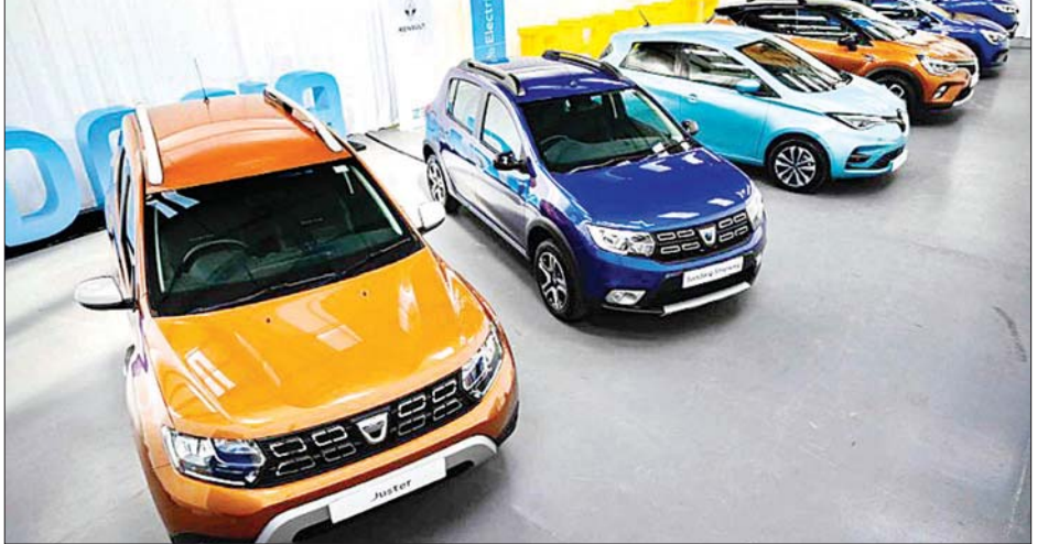
ကားအရောင်းပြခန်းတစ်ခုကို တွေ့ရစဉ်။

ရာခိုင်နှုန်း ကျဆင်းလျက်ရှိသည်။ ဈေးကွက်အတွင်း နေရာအများဆုံးယူထားနိုင်သည့် ဗောက်စ်ဝက်ဂွန် ကားထုတ်လုပ်ရေးမှာ ၄၆ ဒဿမ ၂ ရာခိုင်နှုန်း ကျဆင်းလျက်ရှိသည်။ ဂျပန်ကားထုတ်လုပ်ရေး ကုမ္ပဏီများတွင်လည်း ဟွန်ဒါကုမ္ပဏီမှာ ၆၇ ဒဿမ ၅ ရာခိုင်နှုန်း ကျဆင်းပြီး နစ်ဆန်းကုမ္ပဏီအတွက် ၆၀ ဒဿမ ၃ ရာခိုင်နှုန်း နှင့် တိုယိုတာကုမ္ပဏီမှာ ၄၁ ဒဿမ ၂ ရာခိုင်နှုန်းကျဆင်း လျက်ရှိသည်။ ကားထုတ်လုပ်ရေးကုမ္ပဏီများသည် ဥရောပတွင် ကားထုတ်လုပ်မှုများ တစ်စိတ်တစ်ပိုင်းပြန်လည်စတင်ရန် စီစဉ်နေပြီး အရောင်းဈေးကွက်ပြန်ကောင်းလာရေး အချိန်အတန်ကြာယူရဦးမည်ဟု ယူဆထားကြသည်။ အင်န်အိတ်ချ်ကေ