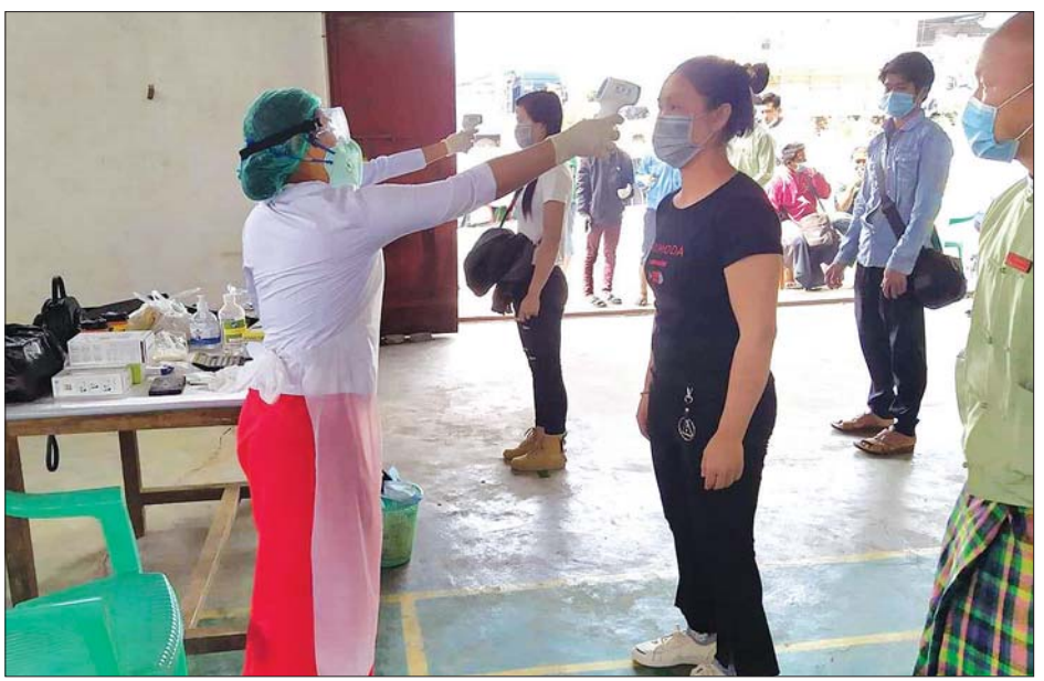
နယ်စပ်မှ ဝင်ရောက်လာသူများအား ကျန်းမာရေးစစ်ဆေးပေးစဉ်။

အလားတူ ကန်ပိုက်တီမြို့နယ်စပ်ဂိတ်၌လည်း မြို့