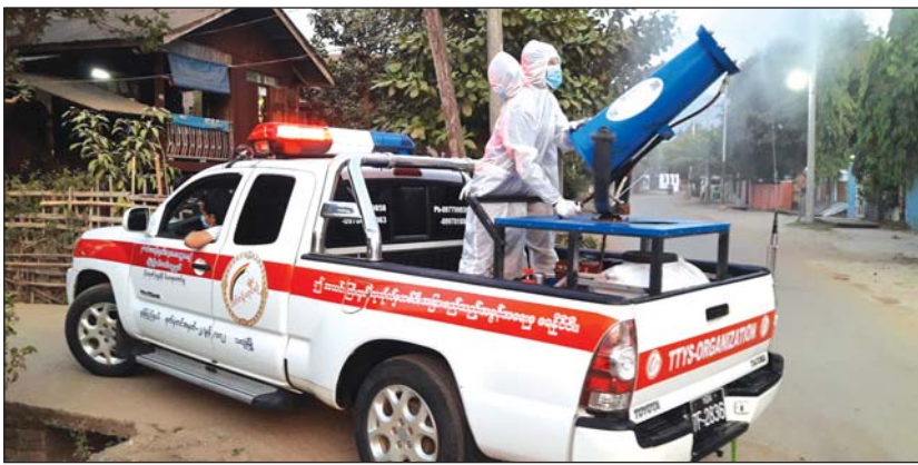
သထုံမြို့ပေါ် ရပ်ကွက်တစ်ခု၌ ပိုးသတ်ဆေးဖျန်းနေစဉ်

ဆေးဖျန်းယာဉ်များဖြင့် ပိုးသတ်ဆေးဖျန်းခြင်းကို သထုံမြို့ရှိ အနှိုင်းမဲ့မေတ္တာ သွေးနှင့်အောက်ဆီဂျင် အခမဲ့ကူညီရေးအသင်း၊ အဖြူရောင်နုလုံးသားလူမှုကယ်ဆယ်ရေးအသင်းနှင့် သက်တန်ရောင်စဉ်လူမှုကယ်ဆယ်ရေးအသင်းတို့ ပူးပေါင်းဆောင်ရွက်ခြင်းဖြစ်ပြီး သထုံမြို့နယ်အတွင်းရှိ ကိုဗစ်-၁၉ သီးသန့်စောင့်ကြည့်စခန်းများ၊ ဌာနဆိုင်ရာရုံးအဆောက်အအုံများကိုပါ ပိုးသတ်ဆေးဖျန်း လိုက်လံဖျန်းပေးလျက်ရှိကြောင်း သိရသည်။ သက်ဦး(သထုံ)