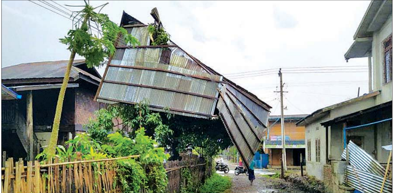
ရှမ်းပြည်နယ် မိုင်းခတ်မြို့နယ်တွင် လေပြင်းတိုက်ခတ်မှုကြောင့် နေအိမ်များပျက်စီးနေမှုကို တွေ့ရစဉ်။

မြန်မာနိုင်ငံအနေဖြင့် မိုးကြိုကာလများဖြစ်သော မတ်၊ ဧပြီနှင့် မေလများ အတွင်း လေပြင်းတိုက်ခတ်ခြင်း၊ မိုးတိမ်တောင်များဖြစ်ပေါ်ခြင်း၊ မိုးကြိုးပစ်ခြင်း၊ မိုးသီးကြွေခြင်းများ ဖြစ်ပေါ်လေ့ရှိပြီး ယခုနှစ်တွင်လည်း လေပြင်းတိုက်ခတ်မှုများ စတင်ဖြစ်ပွားလျက်ရှိရာ ဧပြီ ၁၇ ရက်က ဧရာဝတီတိုင်းဒေသကြီး ကြိုခင်းမြို့နယ်၌ နေအိမ် ခုနစ်လုံး ပြိုကျပျက်စီး၍ နေအိမ် ၉၆ လုံးနှင့် ဘုန်းကြီးကျောင်း တစ်ကျောင်း အမိုးအကာလန်ပျက်စီးခြင်း၊ စစ်ကိုင်းတိုင်းဒေသကြီး ရေဦးမြို့နယ်၌ နေအိမ် ၂၁ လုံး၊ အရာတော်မြို့နယ်တွင် နေအိမ် သုံးလုံး စုစုပေါင်း နေအိမ် ၂၄ လုံး အမိုးအကာလန် ပျက်စီးခြင်း၊ ရှမ်းပြည်နယ် မိုင်းခတ်မြို့နယ်တွင် နေအိမ်လေးလုံး၊ ဖယ်ခုံမြို့နယ်တွင် နေအိမ် တစ်လုံး စုစုပေါင်း နေအိမ် ၁၆ လုံး