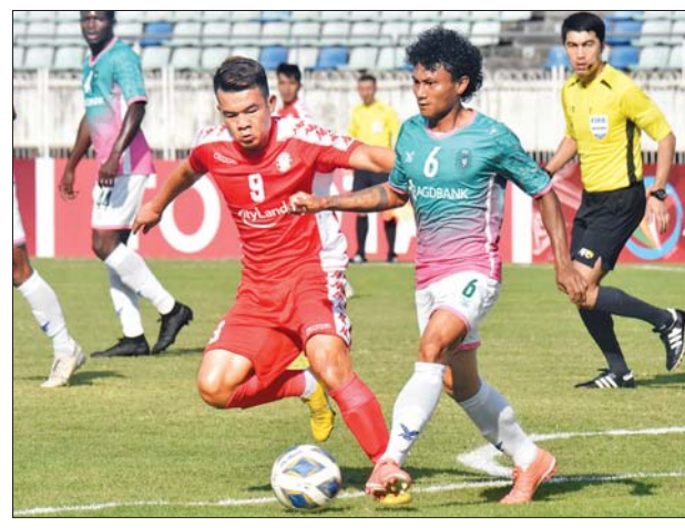
၂၀၂၀ AFC Cup ပြိုင်ပွဲတွင် ရန်ကုန်နှင့် ဟိုချီမင်းစီးတီးအသင်းတို့ ယှဉ်ပြိုင်နေစဉ်။

ဟိုချီမင်းစီးတီးနှင့် နှစ်ဂိုးစီသရေကျသော်လည်း ဟောင်အန်အသင်းကို တစ်ဂိုး-ဂိုးမရှိ၊ လာအိုတိုယိုတာအသင်းကို သုံးဂိုး-နှစ်ဂိုးဖြင့် အနိုင်ရထားသည်။ ရှမ်းယူနိုက်တက်အသင်းသည် အုပ်စု (H) တွင် တစ်ပန်စီရိုဗာ (စင်ကာပူ)၊ ကာယာ (ဖိလစ်ပိုင်)၊ မာကာဆာ (အင်ဒိုနီးရှား)တို့နှင့် ကျရောက်နေပြီး ပထမအကျော့အပြီးတွင် တစ်ပန်စီရိုဗာအသင်းက ခုနှစ်မှတ်၊ ကာယာအသင်းက ငါးမှတ်၊ မာကာဆာအသင်းက လေးမှတ်ရထားပြီး ရှမ်းယူနိုက်တက်အသင်းမှာမူ အမှတ်မရသေးပေ။ ရှမ်းယူနိုက်တက်အသင်းသည် ပထမအကျော့ပွဲစဉ်များတွင် ကာယာအသင်းကို အိမ်ကွင်း၌ နှစ်ဂိုး-ဂိုးမရှိ၊ မာကာဆာအသင်းကို အဝေးကွင်း၌ သုံးဂိုး-တစ်ဂိုး၊ တစ်ပန်စီရိုဗာအသင်းကို အဝေးကွင်း၌ နှစ်ဂိုး-တစ်ဂိုးတို့ဖြင့် ရှုံးနိမ့်ထားသည်။ ရန်ကုန်အသင်းသည် ဒုတိယအကျော့ သုံးပွဲစလုံးကို အဝေးကွင်းကစားရမည်ဖြစ်ပြီး ရှမ်းယူနိုက်တက်အသင်းမှာမူ အိမ်ကွင်းနှစ်ပွဲ၊ အဝေးကွင်းတစ်ပွဲ ကစားရမည်ဖြစ်သည်။ ညီမြတ်သော်တာ