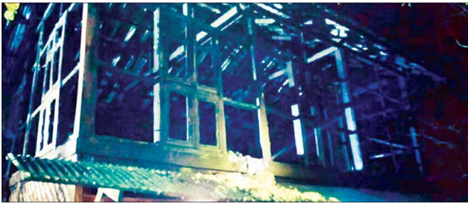
မီးလောင်ပျက်စီးသွားသည့် နေအိမ်အဆောက်အအုံကို တွေ့ရစဉ်။