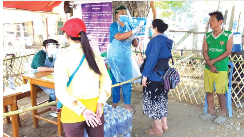
မြို့နယ်အတွင်းသို့ ဝင်ရောက်မည့်သူများအား နယ်စပ်ဂိတ်တစ်ခု၌ စစ်ဆေးနေစဉ်။