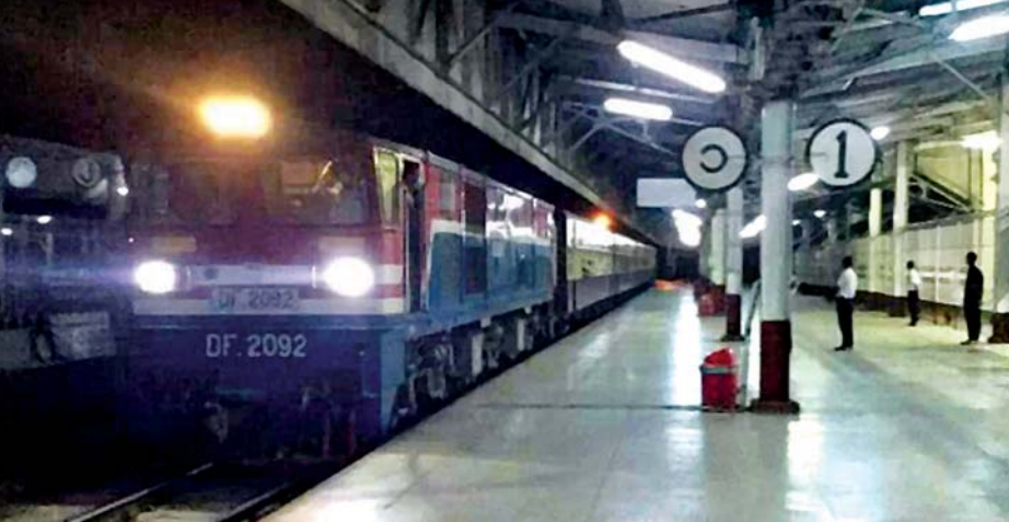
ရန်ကုန်ဘူတာကြီးမှ ထွက်ခွာမည့် အမြန်ရထားတစ်စင်းအား တွေ့မြင်ရစဉ်။

အမှတ် (၃) အဆန် အမြန်ရထားသည် ရန်ကုန်မှ ညနေ ၃ နာရီ ၄၅ မိနစ်တွင် စတင်ထွက်ခွာမည်ဖြစ်ပြီး