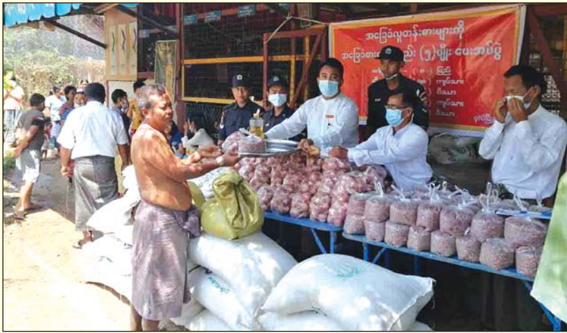
ပုလဲမြို့နယ်မှ ရွာတစ်ရွာ၌ စားသောက်ကုန်ငါးမျိုး ဖြန့်ဝေထောက်ပံ့ပေးစဉ်။

ပုလဲ ဧပြီ ၁၈ စစ်ကိုင်းတိုင်းဒေသကြီး ပုလဲမြို့နယ်အတွင်းရှိ ရပ်ကွက်နှင့်ကျေးရွာများမှ ပုံမှန်ဝင်ငွေမရှိသော အခြေခံလူတန်းစား အိမ်ထောင်စုများအတွက် နိုင်ငံတော်အစိုးရက ထောက်ပံ့သည့် အခြေခံစားကုန်ပစ္စည်း ငါးမျိုးကို ဖြန့်ဝေပြီးစီးပြီဖြစ်ကြောင်းနှင့် မြို့နယ်အတွင်းရှိ ကျေးရွာ ၂၄ ရွာ အနေဖြင့် ထောက်ပံ့သည့် အခြေခံစားကုန်ပစ္စည်း ငါးမျိုးကို နိုင်ငံတော်အစိုးရသို့ ပြန်လည်လှူဒါန်းခဲ့ကြောင်း မြို့နယ်အထွေထွေအုပ်ချုပ်ရေးဦးစီးဌာနမှ သိရသည်။