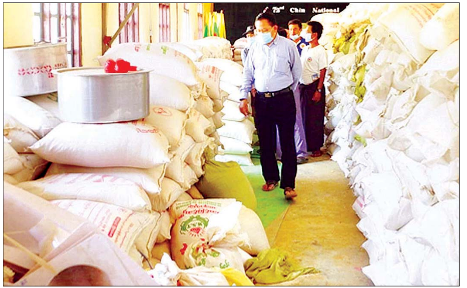
ပြည်နယ် စည်ပင်သာယာရေး၊ လျှပ်စစ်နှင့်စက်မှုလက်မှုဝန်ကြီး ဦးစိုးထက် ပလက်ဝမြို့သို့ ပို့ဆောင်မည့် ရိက္ခာဆန်များအား ကြည့်ရှုစစ်ဆေးစဉ်။

ပြည်နယ် စည်ပင်သာယာရေး၊ လျှပ်စစ်နှင့်စက်မှု လက်မှုဝန်ကြီး ဦးဆောင်သည့်အဖွဲ့သည် ဧပြီ ၁၅ ရက်မှ ၁၇ ရက်အထိ သုံးရက်ကြာ ဆမီးမြို့သို့ သွားရောက်၍ ဆမီးမြို့ရှိ ဌာနဆိုင်ရာများ၊ ရပ်ကွက်အုပ်ချုပ်ရေးမှူးများနှင့် အရပ်ဘက်အဖွဲ့အစည်းများကို ဆမီးမြို့ စည်ပင်သာယာရေးဧည့်ရိပ်သာ အစည်းအဝေးခန်းမ၌ တွေ့ဆုံပြီး ချင်းပြည်နယ်အသီးသီးရှိ နေရပ်စွန့်ခွာသူများ၏ အခြေအနေများ၊ ပြည်နယ်အစိုးရမှ နေရပ်စွန့်ခွာသူများအတွက် စီစဉ်ဆောင်ရွက်ထားမှု အခြေအနေများနှင့် စီမံခန့်ခွဲမှု အခြေအနေများ၊ ဆမီးမြို့ရှိ နေရပ်စွန့်ခွာသူများ၏ အခြေအနေများ၊ စားဝတ်နေရေးအခြေအနေများ၊ မိုးရာသီကာလအတွက် ကြိုတင်ပြင်ဆင်ရမည့်အကြောင်းအရာများနှင့် အခြားလိုအပ်ချက်များကို အပြန်အလှန်ဆွေးနွေးကြကာ ပလက်ဝမြို့နေရပ်စွန့်ခွာသူများနှင့် ဆမီးမြို့နေရပ်စွန့်ခွာသူများအတွက် နေရပ်စွန့်ခွာစခန်းအသစ်များ ဆောက်လုပ်နိုင်ရန်အတွက် ပြည်နယ်စည်ပင်သာယာရေး၊ လျှပ်စစ်နှင့် စက်မှုလက်မှုဝန်ကြီးက စရန်ငွေကျပ်သိန်း ၃၀၀ ကို ပေးအပ်ရာ သက်ဆိုင်ရာတာဝန်ရှိသူများက