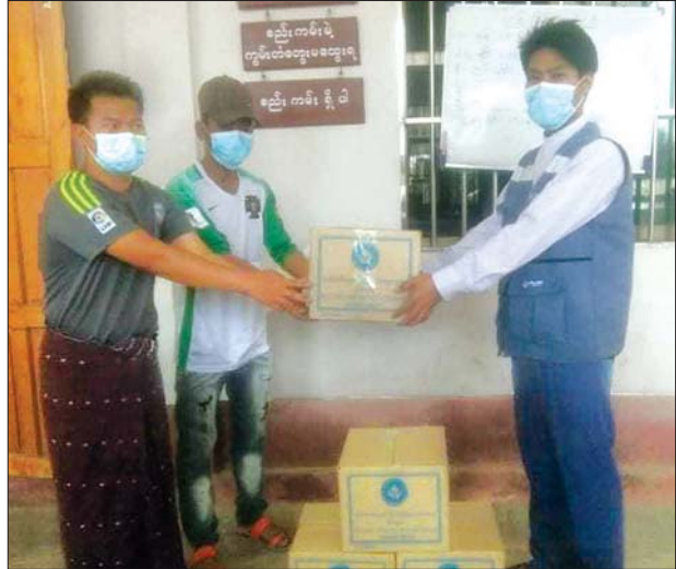
လူမှုဝန်ထမ်း၊ ကယ်ဆယ်ရေးနှင့်ပြန်လည်နေရာချထားရေးဝန်ကြီးဌာနမှ ရှမ်းပြည်နယ် မိုင်းခတ်မြို့နယ် လေဘေးအတွက် ထောက်ပံ့ပစ္စည်းများ ပေးအပ်စဉ်။

အမိုးအကာလန်ပျက်စီးခြင်း၊ ပြည်ထောင်စုနယ်မြေ နေပြည်တော် ဥတ္တရသီရိမြို့နယ်၌ နေအိမ် လေးလုံး အမိုးအကာလန် ပျက်စီးခြင်း၊ ကချင်ပြည်နယ် မိုးကောင်းမြို့နယ်တွင် နေအိမ် ကိုးလုံးနှင့် ဘာသာရေးကျောင်း တစ်ကျောင်း အမိုးအကာလန်ပျက်စီးခြင်းနှင့် လူတစ်ဦးသေဆုံးခြင်းတို့ ဖြစ်ပွားခဲ့သည်။ လူမှုဝန်ထမ်း၊ ကယ်ဆယ်ရေးနှင့် ပြန်လည်နေရာချထားရေးဝန်ကြီးဌာန ဘေးအန္တရာယ်ဆိုင်ရာ စီမံခန့်ခွဲမှုဦးစီးဌာန၊ သက်ဆိုင်ရာတိုင်းဒေသကြီး၊ ပြည်နယ်ရုံးများမှ တာဝန်ရှိသူများသည် လေပြင်းတိုက်ခတ်မှုဖြစ်ပွားရာနေရာများသို့ သွားရောက်ထောက်ပံ့မှုများဆောင်ရွက်လျက်ရှိရာ ဆန်ရိက္ခာဖိုးနှင့် အိမ်ဆောက်ပစ္စည်းဖိုးများ စုစုပေါင်း ငွေကျပ် ၅၆၀၀၀၀၀ ကျော် ထောက်ပံ့