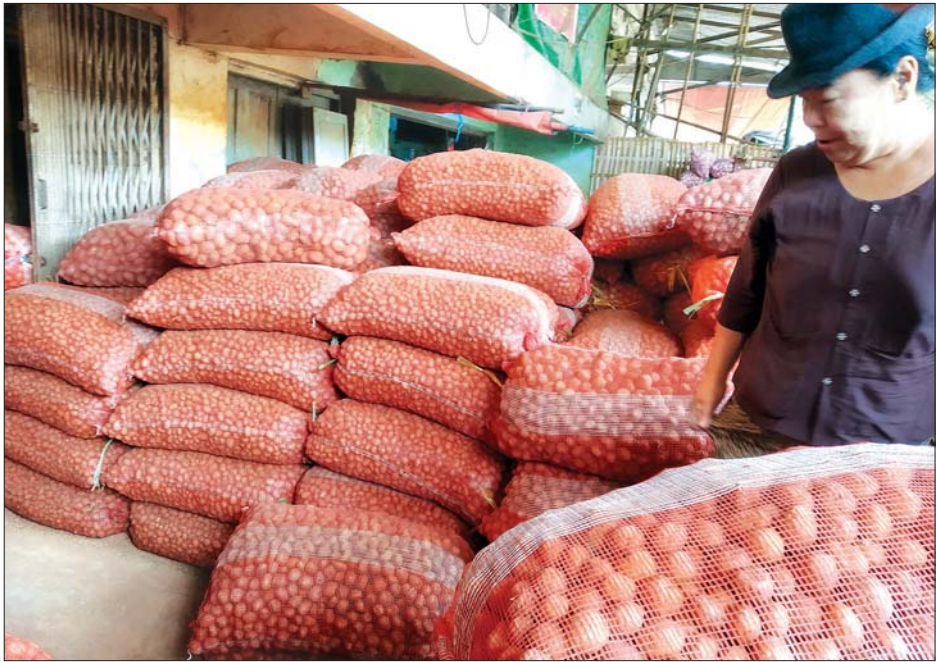
တရုတ်ကြက်သွန်နီအလုံးကြီးအိတ်များမှာ ဝယ်ယူမှုရှိ၍ အရည်ထွက်ခြင်းများရှိနေသည်ကို မြင်ရသည်ဟု ကြက်ပွဲရုံအပြင်ဘက်တွင် အပင်ပေါက်ခြင်း၊ အောက်ခြေတွင် သွန်နီအဝယ်တော်တစ်ဦးက ပြောသည်။ ခင်ဆိုင်

အချို့ပွဲရုံများတွင် မြစ်သားကြက်သွန်နီပိဿာ အိတ်ကလေးများပြုလုပ်ကာ တစ်အိတ် ငွေကျပ် ခြောက်ထောင်နှုန်းဖြင့် ရောင်းချခြင်းတွေ့ရသည်။ မတ်လလယ်အတွင်း ရန်ကုန်ဈေးကွက်သို့ ဝင်ရောက်လာသော