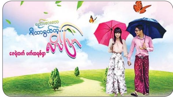
ရည်းစားလာ ဂါထာရွတ်တဲ့ လိပ်ပြာ ဇေရုထက်၊ ပက်ထရစ်ရာ

ကိုဗစ် - ၁၉ ကာကွယ်၊ ထိန်းချုပ်၊ ကုသနိုင်ရေး ပြည်သူများနေအိမ်တွင် နေထိုင်ကြရန် နှိုးဆော်ထားစဉ် ပြည်သူများ စိတ်အပန်းပြေစေရေးနှင့် စိတ်ဓာတ် မြှင့်တင်ပေးနိုင်ရေးကို အထောက်အကူပြုနိုင်ရန် Mahar Mobile Application မှ စုဆောင်းထားသည့် ရုပ်ရှင်နှင့်ဗီဒီယိုဇာတ်ကား လေးထောင်ကျော်အနက်မှ နှစ်ထောင်ကျော်ကို တစ်လတာအခမဲ့ ပြသနေသည်။ အဆိုပါ ရုပ်ရှင်နှင့် ဗီဒီယိုဇာတ်ကားများကို ဧပြီ ၃၀ ရက် အထိ တစ်လတာကြည့်ရှုခွင့် Promo Code အရေအတွက်ပေါင်း သုံးသန်းကို ယင်းကုမ္ပဏီက လျှို့ဝှက်ပေးလျက်ရှိရာ Mahar Mobile App - Code နံပါတ် 230320 ဖြည့်စွက်၍ အခမဲ့ကြည့်ရှုနိုင်သည်။ ပြသလျက်ရှိသည့် ရုပ်ရှင်ဇာတ်ကားများအနက် အချို့မှာ -