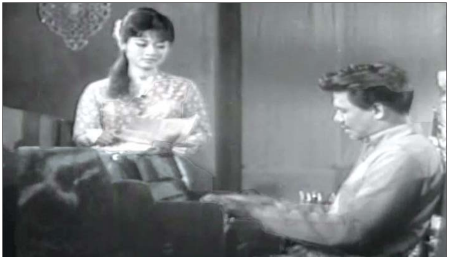
“မုံရွှေရည်” ဇာတ်ဝင်ခန်းတစ်ခန်း။