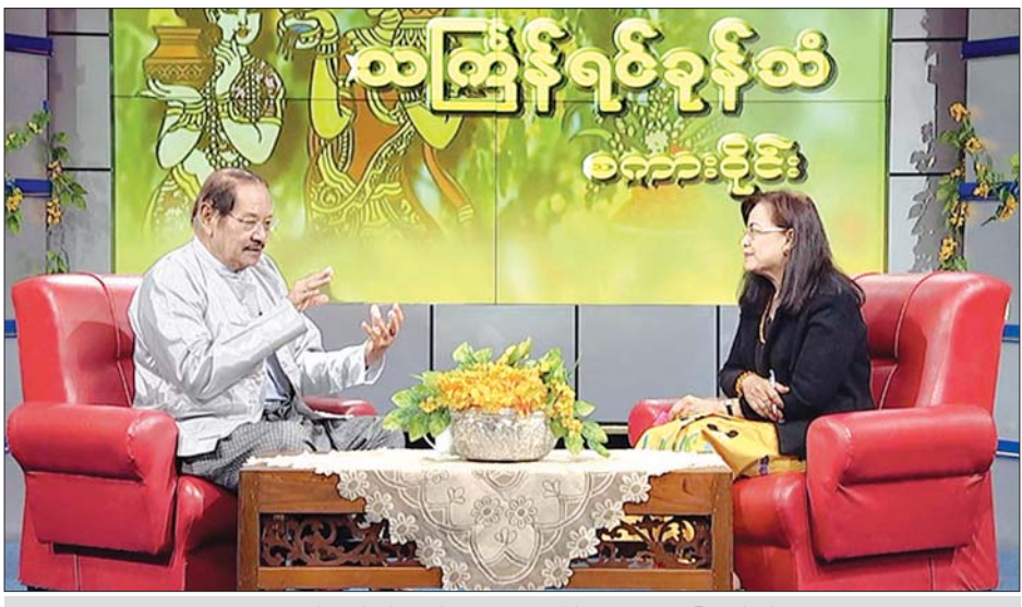
“မုံရွှေရည်” ရုပ်ရှင်ဇာတ်ကား စကားပိုင်းဆွေးနွေးပွဲ ပြုလုပ်စဉ်။

တကယ့် Inspiration ဟာ ဂီတလူလင်ဦးကိုကိုနဲ့ မိသားစုကို အခြေတည်ပြီး ရိုက်ထားတဲ့ အတွက်ကြောင့် တကယ့်ကို ကျွန်မတို့ သဘင်ထဲမှာပါနေတဲ့ သဘင် ပညာရှင်တွေရဲ့ အခန်းကဏ္ဍကိုလည်း တွေ့ရတယ်။ နောက်မြန်မာ့ဂီတရဲ့ အခန်းကဏ္ဍကိုလည်း တွေ့ရတယ်။ နောက် စန္ဒာရား ဆရာတစ်ယောက်ရဲ့ ပုံရိပ်ကိုလည်း သေသေချာချာ မြင်ရတာဖြစ်ပါတယ်။ နောက်သီချင်း လေးလည်း ဆိုတယ်နော်။ ကိုယ်တိုင်ဆိုထားတဲ့သီချင်း လေးကို စင်ပေါ်မှာတော့ သီချင်းဟာ Play Back