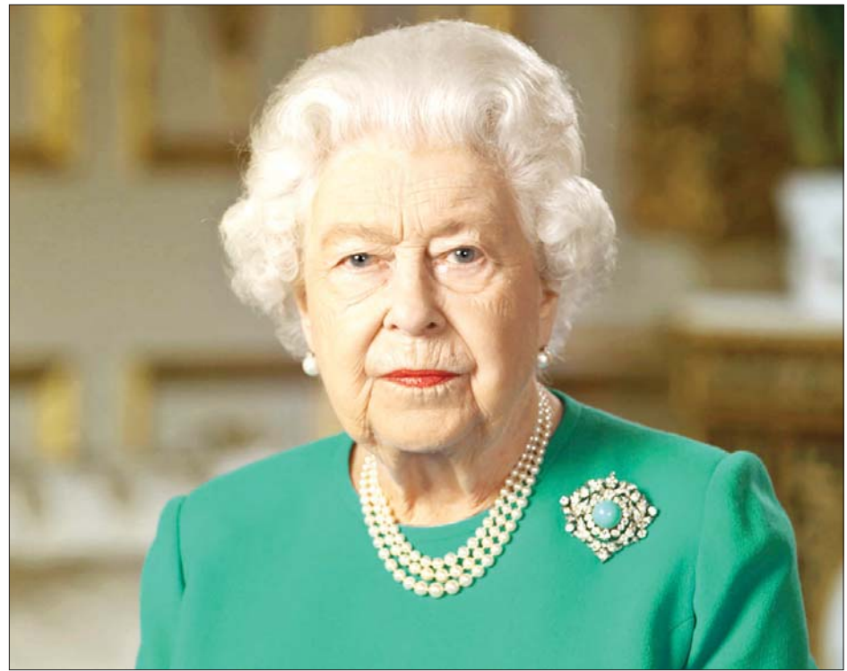
ဗြိတိန်ဘုရင်မကြီး အဲလစ်ဘော့တ်