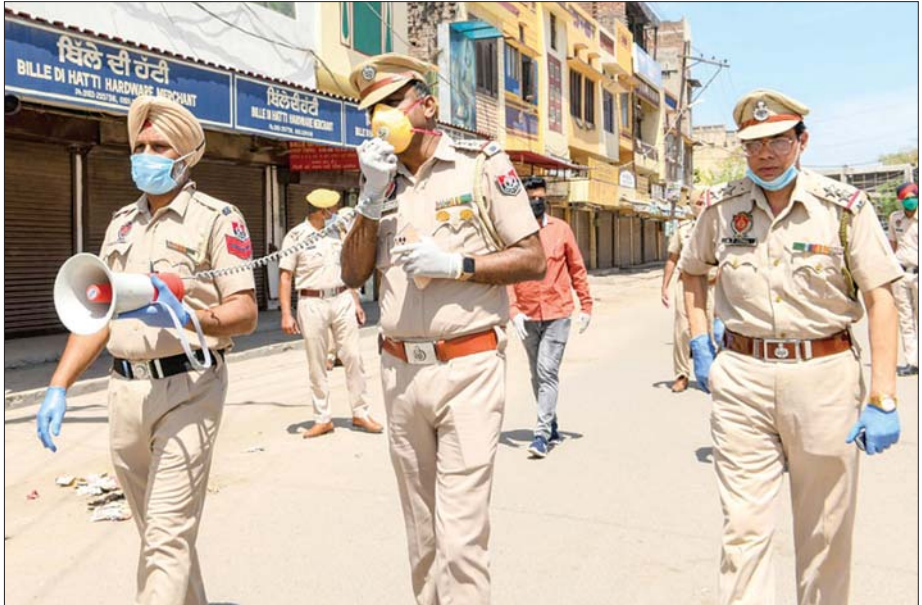
အိန္ဒိယတွင် ပိတ်ဆို့ကန့်သတ်မှုပြုလုပ်ကြောင်းရဲအရာရှိများက အသိပေးနေစဉ်။

ဒေသတွင်းအင်အားကြီးနိုင်ငံဖြစ်တဲ့ အိန္ဒိယမှာတော့ ဧပြီ ၁ ရက်ဆိုရင် ဘဏ္ဍာနှစ် စတင်ပါတယ်။ အရင်တုန်းက တော့ ယခုဘဏ္ဍာနှစ်အတွင်း အိန္ဒိယနိုင်ငံရဲ့ စီးပွားရေး တိုးတက်မှုနှုန်းဟာ ၄ ဒသမ ၈ ရာခိုင်နှုန်းကနေ ၅ ဒသမ ၀ ရာခိုင်နှုန်းအထိ ရှိနိုင်တယ်လို့ ခန့်မှန်းထားခဲ့ပေမယ့် ၁ ဒသမ ၅ ရာခိုင်နှုန်းကနေ ၂ ဒသမ ၈ ရာခိုင်နှုန်းအထိသာ တိုးတက်မှုရှိလိမ့်မယ်လို့ ကမ္ဘာ့ဘဏ်က ခန့်မှန်းထားပါတယ်။ ကပ်ရောဂါကြောင့် ဒေသတွင်းမည်မျှမှုတွေ ဖြစ်လာလိမ့်မယ်လို့လည်း ဒီအစီရင်ခံစာက သတိပေးထားပါတယ်။ ပုံမှန်တရားဝင်မဟုတ်တဲ့ အလုပ်သမားတွေ အတွက်ကတော့ ကျန်းမာရေးစောင့်ရှောက်မှု လျော့နည်းတာ ဒါမှမဟုတ် ကျန်းမာရေးစောင့်ရှောက်မှု လုံးဝမရတာ၊ လူမှုရေးဆိုင်ရာ လုံခြုံမှုမရတာတွေ ဖြစ်လာနိုင်တယ်လို့