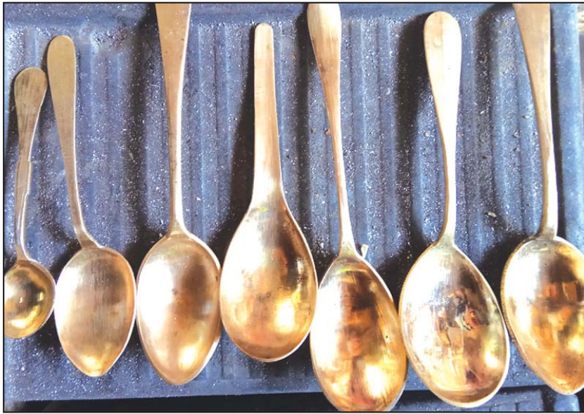
မြန်မာ့ရိုးရာ ကြေးဇွန်းများကို တွေ့ရစဉ်။

မန္တလေးတိုင်းဒေသကြီး ရမည်းသင်းခရိုင် ပျော်ဘွယ်မြို့နယ် မင်းလမ်း(မြောက်)ရွာတွင် မြန်မာ့ရိုးရာ ကြေးဇွန်းခတ်လုပ်ငန်းကို လုပ်ကိုင်ပါသည်။ ရှေးမြန်မာမင်းများလက်ထက်ကပင် စတင်လုပ်ကိုင်ခဲ့သည်ဟု ဆိုပါသည်။ အင်္ဂလိပ်အုပ်စိုးစဉ်ကလည်း ချစ်တီးများက ရိုးတံအရည်၊ ခွက်နက်သော ဇွန်းပုံစံပေး၍ ပြုလုပ်စေကာ အိန္ဒိယသို့တင်ပို့ခဲ့သည်ဟု ဆိုပါသည်။ ပျောက်ကွယ်လုနီးပါးဖြစ်နေ