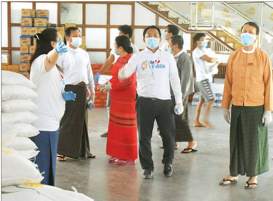
၏ လုပ်ငန်းဆောင်ရွက်မှုအခြေအနေများကို လိုက်လံကြည့်ရှုအားပေးခဲ့သည်။ ကိုဗစ် - ၁၉ ရောဂါကာလအတွင်း