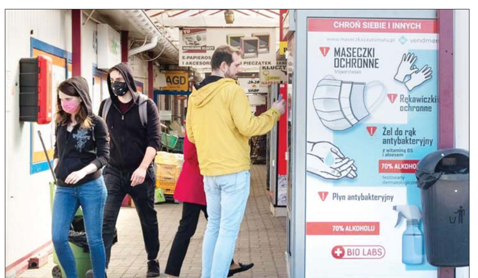
ပိုလန်နိုင်ငံ ဝါဆောမြို့တွင် လူဝင်ရှားသွားလာနေကြသည့် ပြည်သူများအား ဧပြီ ၁၁ ရက်က တွေ့ရစဉ်။