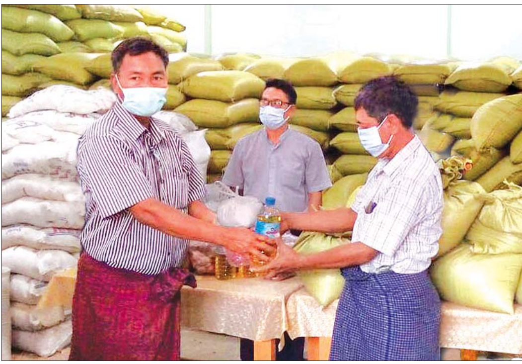
လယ်ဝေးမြို့နယ် သာဝတ္ထိကျေးရွာ၌ အခြေခံစားသောက်ကုန်များ ထောက်ပံ့ပေးအပ်စဉ်။

နေပြည်တော် ဧပြီ ၁၂ နေပြည်တော်ကောင်စီနယ်မြေ မြို့နယ်များအတွင်းရှိ ရပ်ကွက်၊ ကျေးရွာများမှ ပုံမှန်ဝင်ငွေမရှိသော အိမ်ထောင်စုများထံ နိုင်ငံတော်က လှူဒါန်းသည့် အခြေခံစားသောက်ကုန်များဖြစ်သည့် ဆန်၊ ဆီ၊ ဆား၊ ပဲနှင့် ကြက်သွန် စားသောက်ကုန်များကို ဧပြီ ၁၀ ရက်မှ စတင်ထောက်ပံ့ပေးအပ်လျက်ရှိရာ ယနေ့တွင်လည်း ဆက်လက်ထောက်ပံ့ပေးအပ်လျက်ရှိသည်။