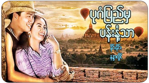
ပုဂံပြည်မှ ပန်းနံ့သာ နိုင်နိုင်၊ နန္ဒာလှိုင်