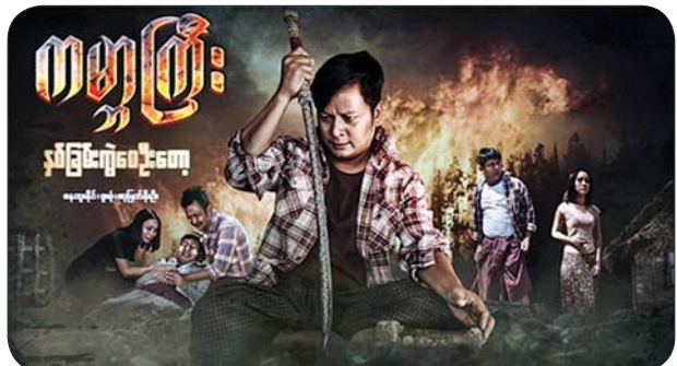
ကမ္ဘာကြီးနှစ်ခြမ်းကွဲစေဦးတော့ နေထူးနိုင်၊ ဖူးစုံ၊ ဆုမြတ်နိုးဦး