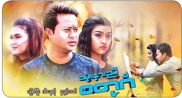
သုံးနားညီ စတုဂံ(ပိတ်) ပြေတီဦး၊ အိချောပို၊ ဖူးပွင့်သခင်