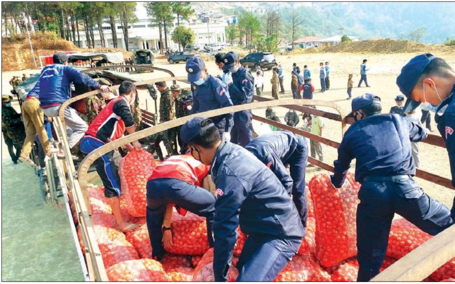
ထောက်ပံ့မည့် စားသောက်ကုန်များ ယာဉ်ပေါ်သို့ တင်ဆောင်စဉ်။

ဟားခါး ဧပြီ ၁၂ ချင်းပြည်နယ်အတွင်း ပုံမှန်ဝင်ငွေမရှိသော အခြေခံလူတန်းစားအိမ်ထောင်စုများအတွက် အခြေခံစားကုန် ငါးမျိုးကို ဧပြီ ၁၀ ရက်က စတင်ထောက်ပံ့ပေးလျက်ရှိသည်။ ကျန်ရှိနေသေးသော အိမ်ထောင်စုများအတွက် ချင်းပြည်နယ် အစိုးရအဖွဲ့က ကိုဗစ်-၁၉ ရောဂါထိန်းချုပ်ရေးနှင့် အရေးပေါ်တုံ့ပြန်ရေးကော်မတီဝင်များ၊ သက်ဆိုင်ရာ ခရိုင်မြို့နယ် အုပ်ချုပ်ရေးမှူးများ၊ လူမှုရေးအသင်းအဖွဲ့များပူးပေါင်း၍ အခြေခံစားကုန် ပစ္စည်းများ အချိန်နှင့်တစ်ပြေးညီ ရောက်ရှိရေး၊ အခြေခံလူတန်းစား အိမ်ထောင်စုများအတွက် အိမ်တိုင်ရာရောက် ပို့ဆောင်ပေးလျက်ရှိသည်။