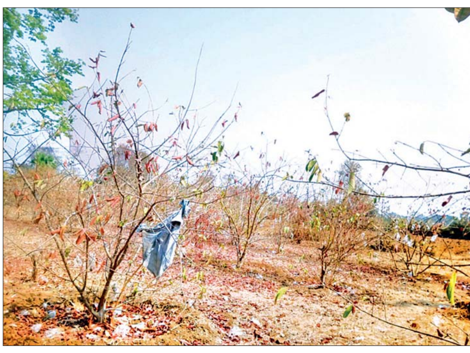
ပျက်စီးနေသည့် မာလကာခြံကို တွေ့ရစဉ်။

မာလကာခြံစိုက်ပျိုးကြရာတွင် ခြောက်လ မာလကာပင်များအား ပျိုးပင်ရောင်းချသည့် ဆည်ပေါက်ကျေးရွာမှ ဝယ်ယူစိုက်ပျိုးခြင်း၊ ကိုယ်တိုင်ပျိုးထောင်ကာ စိုက်ပျိုးခြင်း