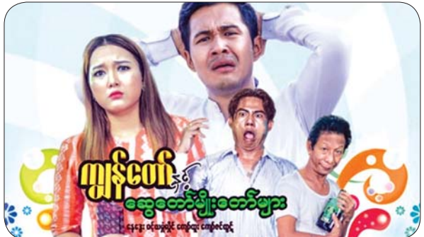
ကျွန်တော်နှင့် ဆွေတော်မျိုးတော်များ နေဒွေး၊ ဝင့်ယမုံလှိုင်