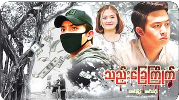
သည်းခြေကြိုက် ကောင်းပြည့်၊ ယမင်းမေဦး