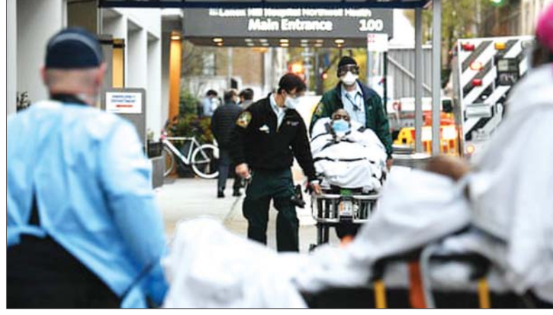
အမေရိကန်ရှိ ဆေးရုံတစ်ရုံ၌ ရောဂါကူးစက်ခံရသူတစ်ဦးကို ခေါ်ဆောင်လာစဉ်။

လက်ရှိ ရောဂါကူးစက်ဖြစ်ပွားသူ အရေအတွက် ၁၅၂၅၀၀ ဦးရှိပြီး သေဆုံးသူ ၁၉၄၆၈ ဦးရှိသည်။ စပိန်၌ ရောဂါကူးစက်ဖြစ်ပွားမှုအခြေအနေ မှာ ၁၆၃၀၂၇ ဦးဖြစ်ပြီး သေဆုံးသူ ၁၆၆၀၆ ဦးအထိရှိသည်။ အမေရိကန်သမ္မတ ဒေါ်နယ် ထရမ်က ဧပြီ ၁၁ ရက်တွင် နိုင်ငံ အနှောက်အယှက်ပိုင်းရှိ ပိုင်ဆိုင်မင်း ပြည်နယ်ကို သဘာဝဘေးအန္တရာယ် ကျရောက်မှု အရေးပေါ်ကြေညာချက် ထုတ်ပြန်ရန် အတည်ပြုခဲ့သည်။ မကြာသေးမီကပင် ဝါရှင်တန်ဒီစီ၊ အမေရိကန် ဗာဂျင်ကျွန်း၊ ဂူအမ်၊ မြောက်ပိုင်း မာရီယာနာကျွန်းစုနှင့် ပွာတိုရီကို အပါအဝင် ပြည်နယ်ပေါင်း ၅၀ တို့တွင် သဘာဝဘေးကျရောက်မှု အရေးပေါ်အခြေအနေကြေညာချက် ထုတ်ပြန်ခဲ့ပြီး ယင်းသို့ထုတ်ပြန်ရမှု သည် အမေရိကန်သမိုင်း၌ ပထမဆုံး အကြိမ်ဖြစ်ကြောင်း ဒေသမီဒီယာက ဖော်ပြသည်။ အဆိုပါ ကြေညာချက်အရ ပြည်နယ်များနှင့် ဒေသအစိုးရအဖွဲ့ များသည် ကိုဗစ်-၁၉ ကပ်ရောဂါကို တိုက်ဖျက်ရာတွင် အထောက်အကူ ဖြစ်စေမည့် ဖက်ဒရယ်ရန်ပုံငွေနှင့် လူ့စွမ်းအားအရင်းအမြစ် အကူအညီ များ ရရှိမည်ဖြစ်ကြောင်း သိရသည်။