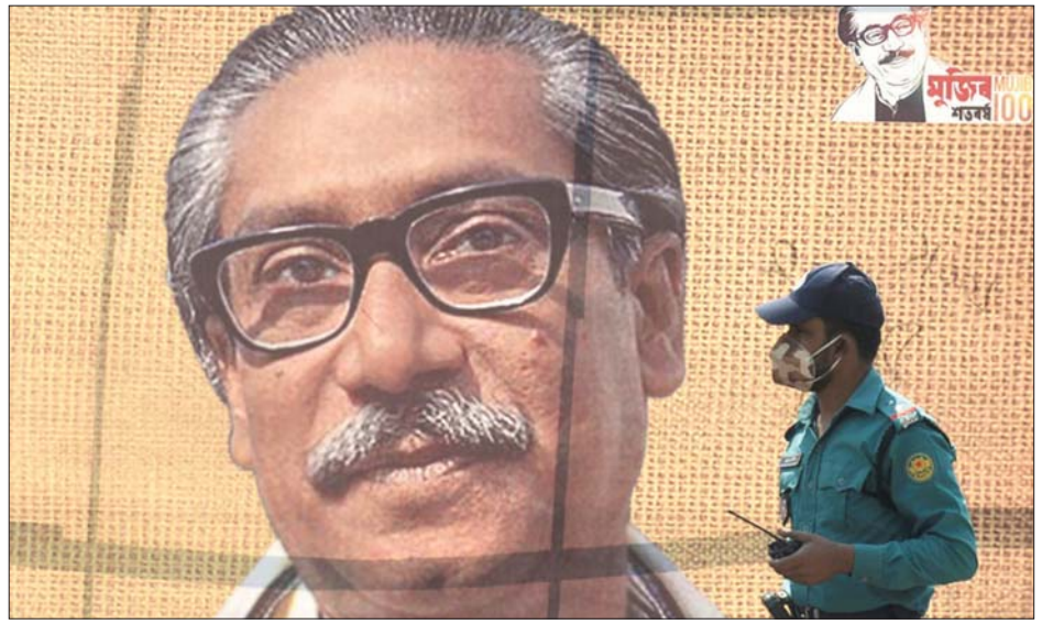
ဒါကာမြို့တွင် အထိမ်းအမှတ်အဖြစ်ထောင်ထားသည့် ရှိတ်ခီမူဂျီဘာရာမန်၏ ပုံစတာကို တွေ့ရစဉ်။