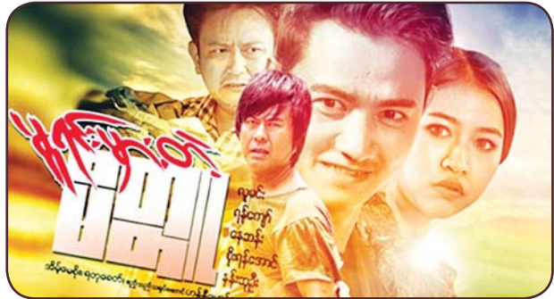
မူရင်းမှားတဲ့ မိတ္တူ လူမင်း၊ ရန်ကျော်၊ နေဆန်း၊ စိုးရန်အောင်၊ နန်းဆုဦး