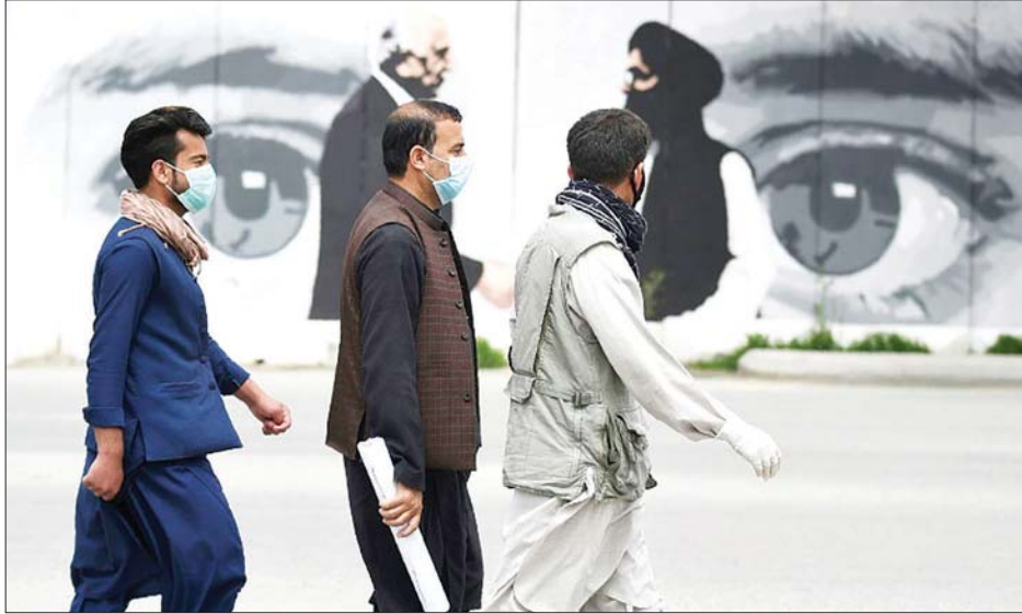
နာခေါင်းစည်းတပ်ဆင်သွားလာနေကြသည့် အာဖဂန်ပြည်သူအချို့။

ကဘူးလ် ဧပြီ ၁၂ အဖွဲ့နှင့် အစိုးရတို့အကြား ဆွေးနွေးပွဲများပြုလုပ်ပြီးနောက် ပြီးခဲ့သည့် ရက်သတ္တပတ်က တာလီဘန်စစ်သွေးကြွ သဘောတူညီမှုတစ်ခုရခဲ့ဟန်ရှိပြီး ရလဒ်အနေဖြင့် အာဖဂန်