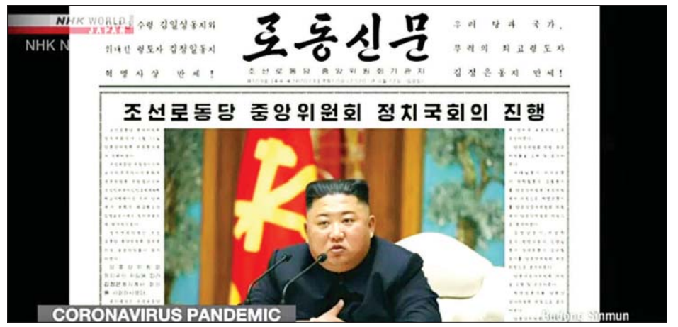
အစည်းအဝေးတက်ရောက်ခဲ့သည့် ခေါင်းဆောင်ကင်၏ ပုံရိပ်ကို ရိုဒေါင်ဆင်မန်သတင်းစာ၌ ဖော်ပြထားစဉ်။

ပြူးယမ်း ဧပြီ ၁၂ မြောက်ကိုရီးယား ခေါင်းဆောင် ကင်ဂျီအန်းသည် ကိုရိုနာဗိုင်းရပ်စ် တိုက်ဖျက်ရေး နောက်ထပ်စီမံ ဆောင်ရွက်မည့် အစီအစဉ်များနှင့် စပ်လျဉ်း၍ ဆွေးနွေးရန် အာဏာရ အလုပ်သမားပါတီ၏ ပေါ်လစီပျူရီ အစည်းအဝေးတစ်ရပ်သို့ တက်ရောက် ခဲ့ကြောင်းသိရသည်။ အဆိုပါ အစည်းအဝေးကို ဧပြီ ၁၂ ရက်က ကျင်းပခဲ့ရာ အလုပ် သမားပါတီ၏ တနင်္ဂနွေနေ့ထုတ် ရိုဒေါင်ဆင်မန် သတင်းစာတွင် ဖော်ပြခဲ့ကြောင်း သိရသည်။ အစည်း အဝေး၌ မြောက်ကိုရီးယားနိုင်ငံ အတွင်း ကိုဗစ်-၁၉ နှင့်ပတ်သက်သည့် အခြေအနေကို အလွန်တည်ငြိမ်သည့် အခြေအနေ တစ်ရပ်အနေဖြင့် ဖော်ပြထားပြီး အာဏာပိုင်များသည် ထိပ်တန်းအဆင့် တင်းကြပ်သော အစီအမံများ ဆောင်ရွက်ထားကြောင်း