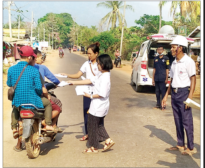
ကျောက်ကြီးမြို့နယ်၌ ကိုဗစ် - ၁၉ ကာကွယ်ထိန်းချုပ်ရေးအတွက် ပြန်ကြားရေးနှင့် ပြည်သူ့ ဆက်ဆံရေးဦးစီးဌာနက သက်ဆိုင်ရာဌာနများနှင့် ပူးပေါင်းပြီး ပြည်သူများအား ရောဂါကာကွယ် ထိန်းချုပ်ရေး လက်ကမ်းစာစောင်များကို ဖြန့်ဝေပေးစဉ်။ ကိုသားကြီး (ကျောက်ကြီး)