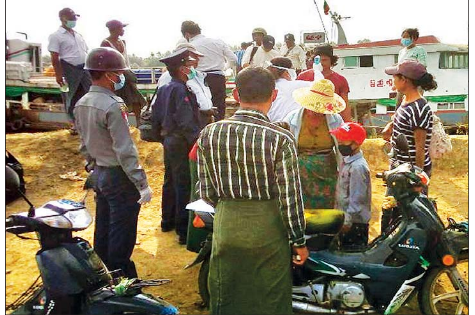
သဲချောင်းကျေးရွာ ကူးတို့ဆိပ်သို့ ရေယာဉ်များဖြင့် ရောက်ရှိလာသည့် ခရီးသွားများအား ကိုဗစ်-၁၉ ရောဂါ ကူးစက်မှုရှိ မရှိ ကျန်းမာရေးစစ်ဆေးဆောင်ရွက်စဉ်။

အရန်မီးသတ်တပ်ဖွဲ့ဝင်များ၊ ဒေသခံများပါဝင်သည့် ပူးပေါင်းအဖွဲ့က ခရီးသွားပြည်သူများအား ကိုဗစ်-၁၉ ရောဂါ ကြိုတင်ကာကွယ်ရေးအတွက် ကျန်းမာရေးစစ်ဆေးမှုများကို စတင်ဆောင်ရွက်ခဲ့ကြောင်း သိရသည်။ ချောင်းဝ၊ ပြင်ခရိုင်၊ ဝါးကုန်း၊ ဒီးဇူးကုန်း၊ အုတ်တွင်းကျေးရွာအုပ်စုများသည် တစ်ဆက်တစ်စပ်တည်း တည်ရှိနေကြသော ကျေးရွာများဖြစ်ပြီး ရန်ကုန်၊ ပုသိမ်မြို့များနှင့် အခြားဒေသများသို့ ခရီးသွားများ နေ့စဉ်သွားလာနေကြသည့် ရေယာဉ်ဆိပ်ကမ်းများ၊ ရန်ကုန်ပြင်ခရိုင် တိုက်ရိုက်ပြေးဆွဲနေသော စာမျက်နှာ ၁၀ ကော်လံ ၁ ✦