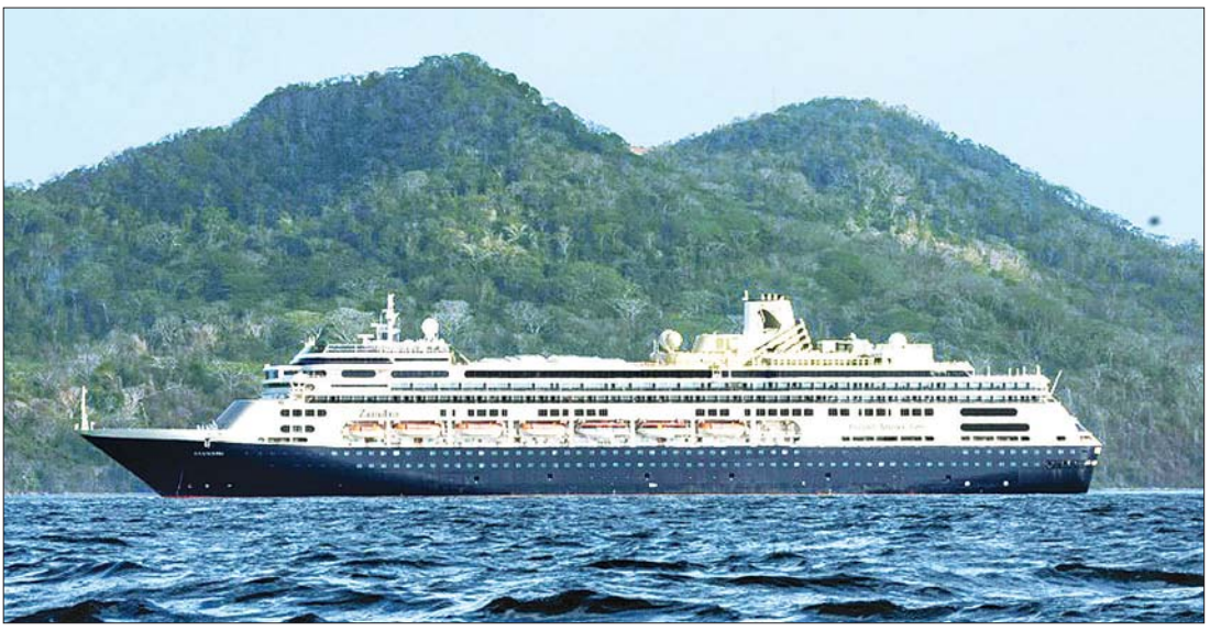
ကိုရိုနာဗိုင်းရပ်စ်ကူးစက်မှုဖြစ်ပွားနေသည့် The Zaandam အပျော်စီးသင်္ဘော