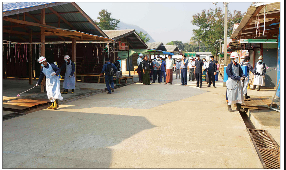
ဒီးမော့ဆိုမြို့မဈေးတွင် ကိုဗစ် - ၁၉ ရောဂါ ကာကွယ်၊ ထိန်းချုပ်ရေးအတွက် မြို့နယ်စီးသတ်တပ်ဖွဲ့ဝင်များ၊ ကျန်းမာရေးဝန်ထမ်းများနှင့် ဈေးကော်မတီဝင်များ မတ် ၃၁ ရက်က ပိုးသတ်ဆေးပက်ဖျန်းနေစဉ်။