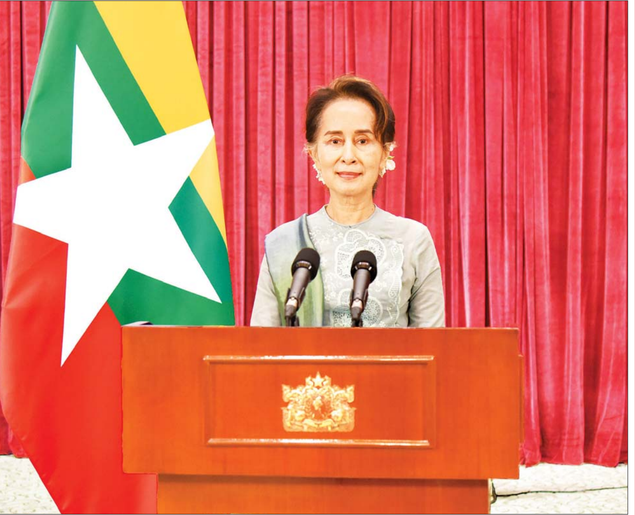
နိုင်ငံတော်၏အတိုင်ပင်ခံပုဂ္ဂိုလ် ဒေါ်အောင်ဆန်းစုကြည်က COVID-19 ဖြစ်ပွားမှု နောက်ဆုံးအခြေအနေနှင့် စပ်လျဉ်း၍ ပြည်သူလူထုသို့ အစီရင်ခံတင်ပြ သည့်မိန့်ခွန်း ပြောကြားစဉ်။

တရုတ်နိုင်ငံက ပြည်တွင်းသို့ ဂျပန်နိုင်ငံသားများ ဝင်ရောက်ခွင့် ပိတ်ပင်မှုကို ပိုမိုတင်းကျပ် နိုင်ငံတကာသတင်း စာ ၁၃