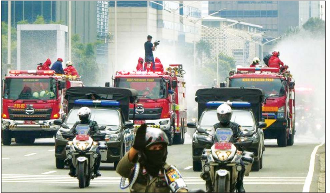
ဂျကာတာမြို့လယ် လမ်းတစ်ခုတွင် စီးသတ်သမားများက ကိုဗစ်-၁၉ ကာကွယ်ဆေးများ ဖျန်းနေစဉ်။

မိမိတို့အနေဖြင့် တခြားနိုင်ငံများ၏ အတွေ့အကြုံများကို အကောင်းဆုံး သင်ခန်းစာယူကြရမည်ဖြစ်ကြောင်း၊ သို့သော်လည်း သူများနိုင်ငံ၏ စနစ် အတိုင်း ပုံတူကူးချခြင်းမရှိကြောင်းနှင့် မိမိတို့၏အခြေအနေနှင့် ကိုက်ညီအောင် အကောင်းဆုံးလုပ်ဆောင်ရမည်ဖြစ်ကြောင်း ဂျိုကိုဝီဒိုဒိုက ဆက်လက် ပြောကြားခဲ့သည်။