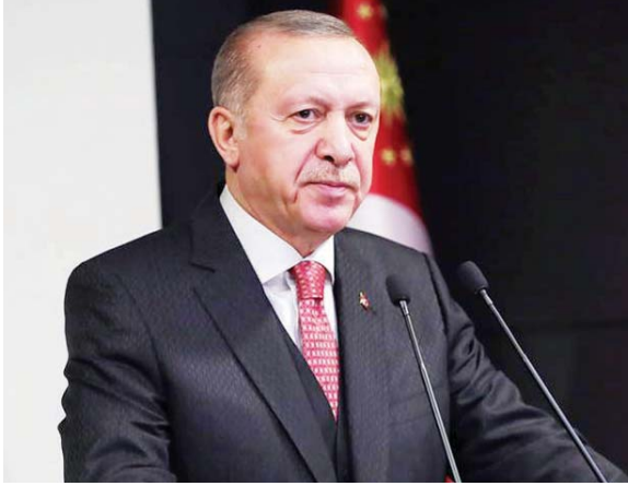
တူရကီသမ္မတ ရီဆက်တေရစ်အာဒိုဂန်