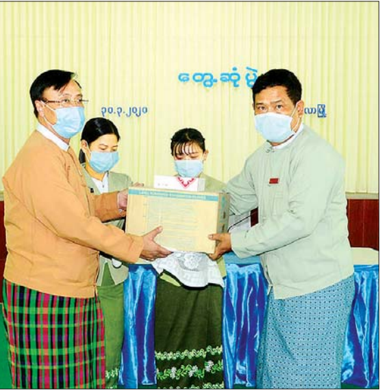
မိတ္ထီလာ၌ ကိုဗစ်-၁၉ ရောဂါကာကွယ် ထိန်းချုပ် ကုသရေးလုပ်ငန်းများအတွက် ထောက်ပံ့ပစ္စည်းများ ပေးအပ်