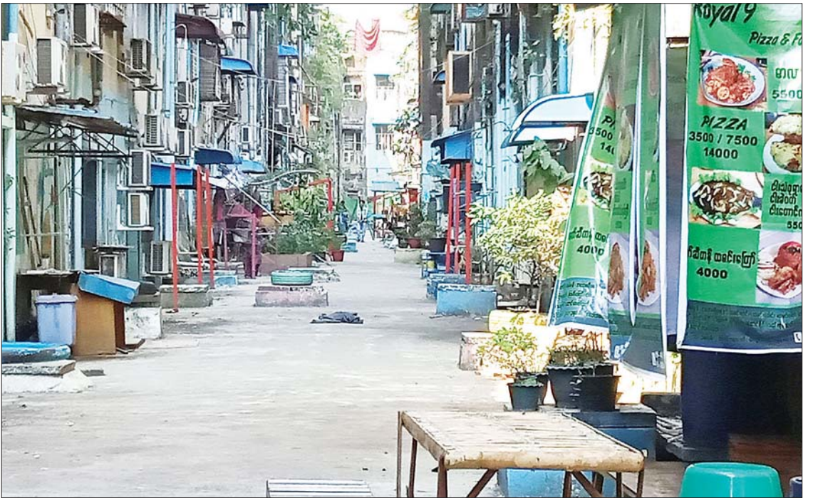
စွန့်ပစ်အမှိုက်များစုပုံနေရာမှ သန့်ရှင်းလှပသော နေချင်စဖွယ်လမ်းကြားတစ်ခုကို တွေ့မြင်ရစဉ်။

မလိုအပ်ဘဲပစ္စည်းများကို ဝယ်ယူသည့်အခါ အမှိုက်ထွက်ရှိနိုင်သောကြောင့် လိုအပ်သောပစ္စည်းများကိုသာ ဝယ်ယူသုံးစွဲခြင်းဖြင့် အမှိုက်ထွက်ရှိမှုကို လျှော့ချခြင်း၊ ကြာရှည်ခံ