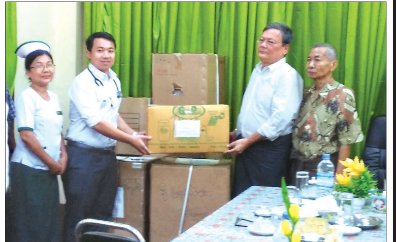
ရခိုင်ပြည်နယ် ဝန်ကြီးချုပ်မှ လှူဒါန်း သောဆေးရုံသုံးပစ္စည်းများ ပေးအပ် လှူဒါန်းပွဲကို မတ် ၃၀ ရက်က တောင်ကုတ်မြို့ ခုတင် ၁၀၀ ပြည်သူ့ဆေးရုံ၌ ကျင်းပစဉ်။ မြို့နယ် (ပြန်/ဆက်)