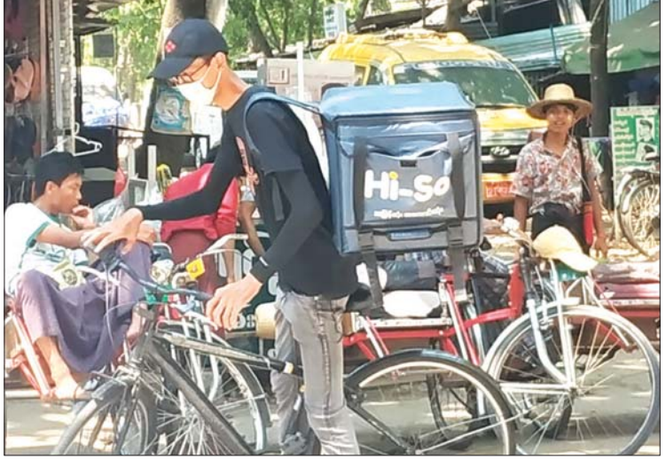
စားသောက်ဖွယ်ရာပစ္စည်းများ ပို့ဆောင်ပေးနေသူတစ်ဦး။

ပြီးပိုင်ခန့်က “ဒီအလုပ်ကိုဝင်လုပ်တာ တစ်နှစ်တော့ မပြည့်သေးပါဘူး။ အခေါက် အရေအတွက်အလိုက် ဝန်ဆောင်ပို့ခက ရတာပါ။ အလုပ်ကကိုယ်ဝင်တဲ့ အချိန်ပါ။ ဥပမာ အလုပ်ချိန် မနက် ၁၀ နာရီမှ ညနေ ၆ နာရီအထိ ယူထားတယ်ဆိုတော့ စုရပ်ကို နာရီဝက် စောရောက်ရတယ်။ ရောက်တာနဲ့ G.P.S ဖွင့်ထားရတယ်။ အားလုံးက ဖုန်းနဲ့ပဲ ဆက်သွယ်လုပ်ရတာပါ။ အဲဒီမှာ ကုမ္ပဏီက တစ်ဆင့် မှာယူတဲ့အစားအသောက်တွေကို မှာတဲ့သူတွေဆီ အရောက်ပို့ဆောင်ပေးရတာပါ။ စက်ဘီးကျင်ကျင်လည်လည် စီးတတ်တဲ့ လူငယ်တွေနဲ့ဆို အလွန်အဆင်ပြေပါတယ်။ ဝန်ဆောင်မှုပေးရတာနဲ့အမျှ ထိုက်ထိုက် တန်တန် လုပ်အားခပြန်ရတဲ့ အလုပ်မို့ လုပ်ရတာ အဆင်ပြေပါတယ်။ မနေ့ကဆို အခေါက်ရေ ၁၇ ကြောင်းရတယ်။ အဲဒီနေ့ အတွက်က ငွေကျပ် ၂၄၀၀၀ ရမယ်။ လုပ်ငန်းထဲမှာ အဆင်ပြေတာတွေလည်းရှိသလို အချို့အဆင်မပြေမှုလေးတွေလည်း ရှိတတ်ပါတယ်။ စက်ဘီးကိုတော့ သတိကြီးကြီးထားပြီး စီးနင်းရပါတယ်။ ကားတွေကြားမှာ အန္တရာယ် တော့ နီးတာပေါ့။ ဒါပေမယ့် အခုလို အလုပ်