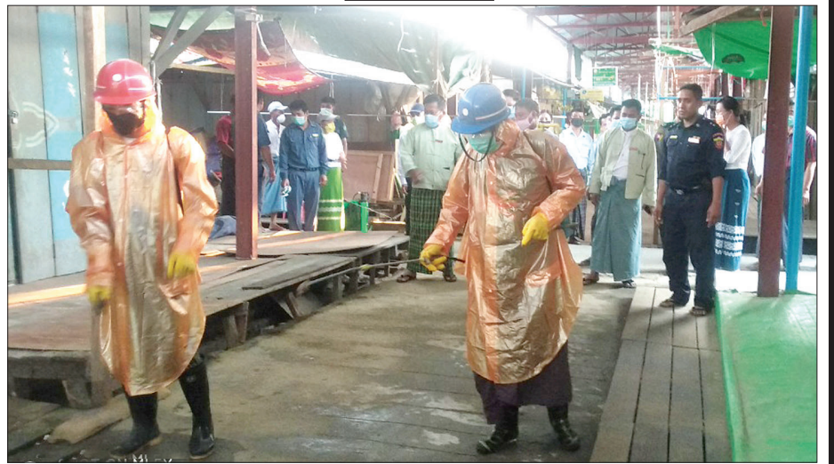
တနင်္ငူမြို့ စည်ပင်သာယာရေးအတွင်း ကိုဗစ် - ၁၉ ရောဂါ ကာကွယ်ရန် မြို့နယ်စည်ပင်သာယာရေးအဖွဲ့မှ ဦးဆောင်၍ ပိုးသတ်ဆေးများ လိုက်လံပက်ဖျန်းနေမှုကို မတ် ၃၁ ရက်က တွေ့ရစဉ်။ မြို့နယ် (ပြန်/ဆက်)