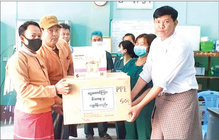
မယ်ခွဲမြို့နယ် ပြည်သူ့ဆေးရုံသို့ ကိုဗစ် - ၁၉ ကြိုတင်ကာကွယ်မှုများ ဆောင်ရွက်နိုင်ရန် ငွေတောင်ကြား မိသားစုမှ ကျန်းမာရေးသုံးပစ္စည်း များကို မတ် ၃၀ ရက်က လာရောက် လှူဒါန်းစဉ်။ ဝတ်ရည် (ပြန်/ဆက်)