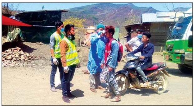
ချင်းပြည်နယ် ရိခေါဒါရဲမြို့ အထွေထွေအုပ်ချုပ်ရေးဦးစီးဌာန၏ ဦးဆောင်မှု ဖြင့် ဌာနဆိုင်ရာများနှင့် ရပ်ကွက်လူငယ်များပူးပေါင်းပြီး ကိုဗစ်-၁၉ ရောဂါ ကာကွယ်ရေးလုပ်ငန်းအဖြစ် မြို့အဝင်အထွက် နေရာများ၌ ကိုယ်ပူချိန် စစ်ဆေးခြင်းနှင့် အသိပညာပေးခြင်း လုပ်ငန်းများကို မတ် ၃၀ ရက်က ဆောင်ရွက်စဉ်။ ပက်ကာ (ပြန်/ဆက်)