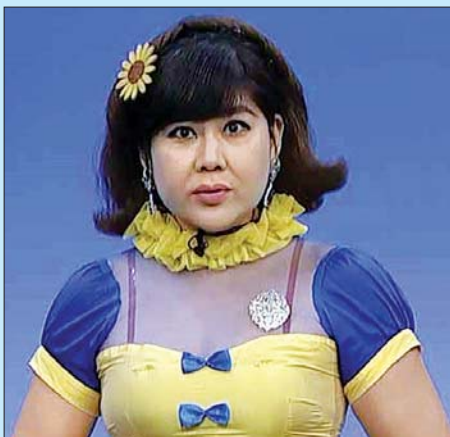
ဆောင်းအိန္ဒြေထွန်း

ချောင်းဆိုး နှာချေတဲ့အခါမှာ တစ်ခါသုံးတစ်ရှူးကို အသုံးပြုပြီး နှာခေါင်းနှင့် ပါးစပ်ကို လုံအောင်ဖုံးအုပ်ပါ။ သုံးပြီးသား တစ်ရှူးကို အမှိုက်ပုံးထဲသို့ စနစ်တကျ စွန့်ပစ်ပါ။ လက်ကို စနစ်တကျ သန့်ရှင်းအောင် ဆေးကြောပါ။