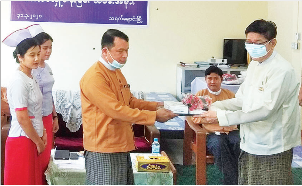
တနင်္သာရီတိုင်းဒေသကြီး ဝန်ကြီးချုပ် ဦးမြင့်မောင် ကိုဗစ် - ၁၉ ရောဂါ ကြိုတင်ကာကွယ်ရေးလုပ်ငန်းများအတွက် PPE ဝတ်စုံနှင့် ကိုယ်အပူချိန်တိုင်းကိရိယာများကို မြို့နယ်ကျန်းမာရေးဦးစီးမှူးထံ မတ် ၃၁ ရက်က လာရောက်လှူဒါန်းစဉ်။ ချိုးချစ်ဦး (ပြန်/ဆက်)