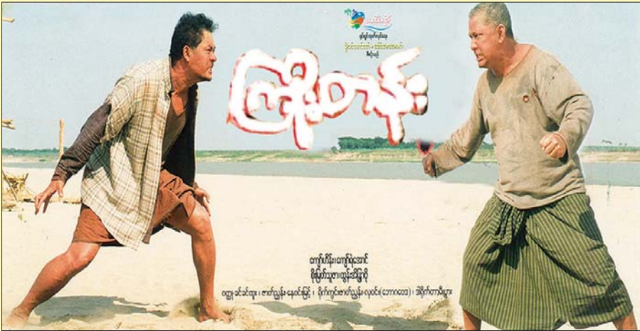
ကြိုးတန်း

၂၀၂၀ ပြည့်နှစ် သင်္ကြန်ကာလအတွင်း မွန်းလွဲ ၁ နာရီခွဲ နှင့် ည ၉ နာရီခွဲတို့တွင် ပြသမည့် မြန်မာ့ရုပ်ရှင်ဇာတ်ကားများနှင့် ဗီဒီယိုဇာတ်ကားများမှာ အောက်ပါအတိုင်း ဖြစ်ပါသည် -