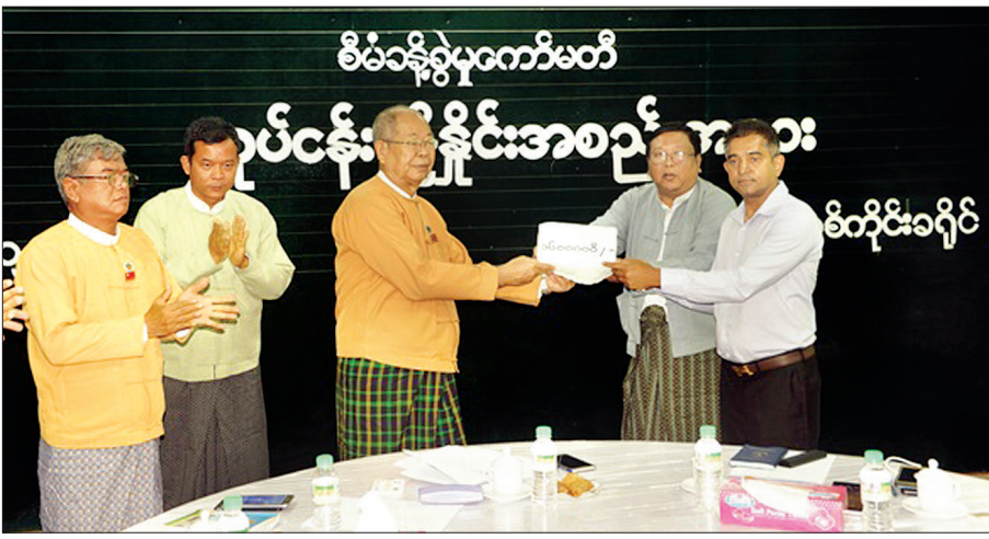
စစ်ကိုင်းမြို့ စက်မှုဇုန်လုပ်ငန်းရှင်များက ကိုဗစ်-၁၉ ရောဂါကာကွယ်ထိန်းချုပ်နိုင်ရေးအတွက် မတ် ၃၁ ရက်တွင် အလှူငွေများ ပေးအပ်လှူဒါန်းရာ စစ်ကိုင်းခရိုင် စီမံခန့်ခွဲမှုကော်မတီမှ တာဝန်ရှိသူများက လက်ခံရယူစဉ်။ ခရိုင် (ပြန်/ဆက်)