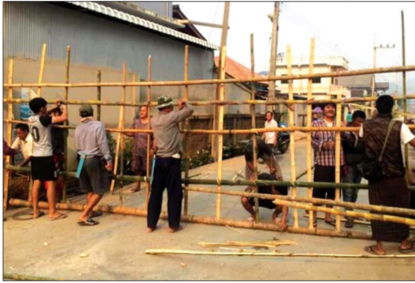
ကျေးရွာတစ်ရွာ၌ ရွာအဝင်လမ်းပေါ်တွင် ဂိတ်တံခါး ပြုလုပ်နေစဉ်

လက်ရှိအချိန်တွင် တာချီလိတ်မြို့နယ်အတွင်း၌ လူအဝင်အထွက်ကန့်သတ်မှုကို ကျေးရွာအစီအစဉ် ဖြင့် လုပ်ဆောင်နေသည့် ရွာပေါင်း ၄၀ ကျော်ရှိနေပြီး ကူးစက်ရောဂါ ကာကွယ်ရေးအတွက် ကျန်းမာရေး အသိစိတ်ဖြင့် ကိုယ့်အားကိုယ်ကိုး လုပ်ဆောင် လာကြခြင်းဖြစ်ကြောင်း၊ အဝင်အထွက် ကန့်သတ်