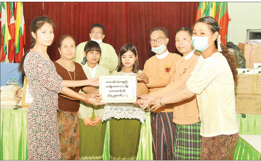
ရမည်းသင်းမြို့နယ် အထွေထွေအုပ်ချုပ်ရေးဦးစီးဌာနရုံး အစည်းအဝေးခန်းမ၌ ကျန်းမာရေးသုံးပစ္စည်းအမျိုးအစား ရှစ်မျိုး ပေးအပ်လှူဒါန်းပွဲကို မတ် ၃၀ ရက်က ကျင်းပစဉ်။ ဇော်ဝင်းအောင် (ပြန်/ဆက်)