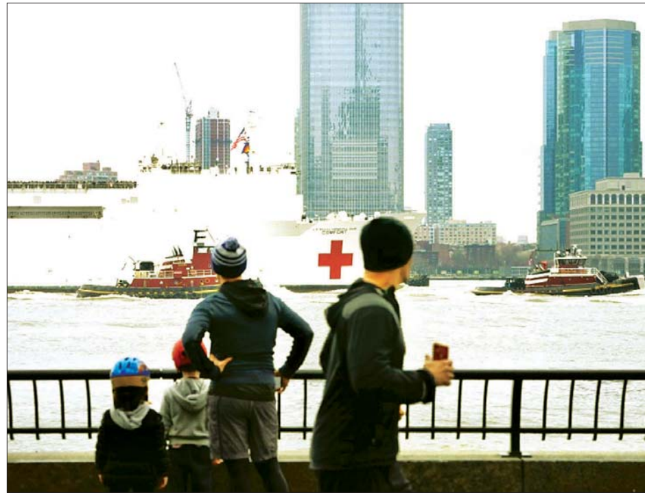
အမေရိကန်ဆေးဘက်ဆိုင်ရာသင်္ဘော ဟတ်ဆန်မြစ်တွင်း ခုတ်မောင်းနေသည်ကို တွေ့ရစဉ်။