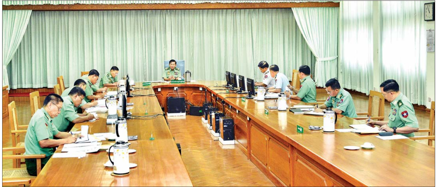
COVID-19 နှင့် ပတ်သက်၍ မြန်မာနိုင်ငံတွင် ပြည်သူများနှင့် တပ်မတော်သားများ၊ မိသားစုဝင်များအတွက် ကာကွယ်ရေး၊ ကုသရေးနှင့် အခြားလိုအပ်ချက်များ ဆောင်ရွက်ပေးနိုင်ရေး ညှိနှိုင်းအစည်းအဝေးကျင်းပစဉ်။