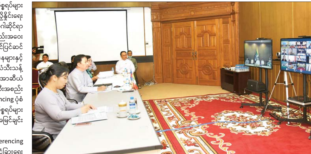
ဝန်ကြီးဌာန၊ ကျန်းမာရေးနှင့် ဆက်သွယ်ရေး ဝန်ကြီးဌာနနှင့် အဆင့်မြင့်ကိုယ်စားလှယ်များ ပါဝင် အားကစားဝန်ကြီးဌာန၊ ပြန်ကြားရေး အလုပ်သမား၊ လူဝင်မှုကြီးကြပ်ရေးနှင့် တက်ရောက်ခဲ့ကြသည်။ သတင်းစဉ်

ထူထောင်ရေး စသည့်ကိစ္စရပ်များ အပြင် အာဆီယံပေါင်းစပ်ညှိနှိုင်းရေး ကောင်စီ၏ COVID-19 ရောဂါဆိုင်ရာ Video Conferencing အစည်းအဝေး ကျင်းပရေးအတွက် ကြိုတင်ပြင်ဆင် ထားရှိမှု အခြေအနေများနှင့် COVID-19 ဆိုင်ရာ အာဆီယံသန့် ထိပ်သီး အစည်းအဝေးနှင့် အာဆီယံ အပေါင်းသုံး သီးသန့်ထိပ်သီးအစည်း အဝေးကို Video Conferencing ပုံစံ ဖြင့် ကျင်းပပြုလုပ်ရေး ကိစ္စရပ်များ အပေါ်တွင် ဆွေးနွေးအမြင်ချင်း ဖလှယ်ခဲ့ကြသည်။ အဆိုပါ Video Conferencing အစည်းအဝေးသို့ နိုင်ငံခြားရေး ဝန်ကြီးဌာန၊ ရင်းနှီးမြုပ်နှံမှုနှင့် နိုင်ငံ ခြား စီးပွားဆက်သွယ်ရေးဝန်ကြီး ဌာန၊ သာသနာရေးနှင့် ယဉ်ကျေးမှု