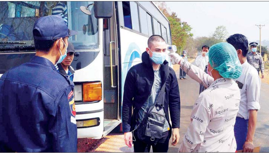
ကိုဗစ်-၁၉ ရောဂါကာကွယ်ထိန်းချုပ်ရေးအတွက် ခရီးသွားများအား ရောဂါကူးစက်မှု ရှိမရှိ အပူချိန်တိုင်းစစ်ဆေးစဉ်။

ခေါင်းအေးအေးထားပြီး ထုတ်ပြန်မှုများ လိုက်နာကြပါ အထူးသဖြင့် အများစိုးရိမ်နေတဲ့ ရောဂါဖြစ်ပွားနေမှုအပေါ် စိုးရိမ်ထိတ်လန့်မှုများ တိုးပွားလာမှာ ဖြစ်တာမို့ “ကြောက်လန့် စိုးရိမ်မှုများမရှိကြပါနဲ့။ ခေါင်းအေးအေးထားပြီး သတိကြီးစွာနဲ့ ကျန်းမာရေးဝန်ကြီးဌာနနဲ့ အခြားအစိုးရဌာနများရဲ့ ထုတ်ပြန်မှုများကို လိုက်နာကြဖို့” တိုက်တွန်းလိုက်ပါတယ်။ ကမ္ဘာ့ကျန်းမာရေးအဖွဲ့ကြီးက အဆိုပါရောဂါဟာ ထိန်းချုပ်လို့ရကြောင်း၊ ဖြစ်ပွားသူတို့ရဲ့ ၄ ဒသမ ၄ ရာခိုင်နှုန်းသာ အသက်ဆုံးရှုံးကြောင်း၊ ရောဂါအခံရှိသူများ၊ ခုခံအားနည်းသူများ၊ ကုသမှုခံယူမှု နောက်ကျသူများသာ အသက်ဆုံးရှုံးလေ့ရှိကြောင်း “စောစောပြော၊ စောစောသိ၊ အားလုံးအကျိုးရှိ” ဆိုတဲ့ အတိုင်း လူတိုင်းစောစောအချိန်မီ လုပ်သင့်သည့်များ လုပ်ဖို့လိုကြောင်း၊ အရေးကြီးသည်မှာ ရောဂါရှိကြောင်း သိရသည်နှင့် ထိုသူနှင့်ထိတွေ့မှုရှိခဲ့သူအားလုံးကျန်းမာရေးဌာနကို အသိပေးညွှန်ကြားသည့်အတိုင်း လိုက်နာဆောင်ရွက်ဖို့လိုကြောင်း၊ ထိုသို့ဆောင်ရွက်ခြင်းသည် မိမိအတွက်လုံခြုံရေး၊ မိမိပတ်ဝန်းကျင်၏ လုံခြုံရေးနှစ်ရပ်စလုံးအတွက်ဖြစ်ကြောင်း စသည်တို့အပြင် မှတ်သားဖွယ် လူစိတ်အခြေအနေတို့ကိုလည်း ထည့်သွင်းပြောကြားခဲ့ပါတယ်။