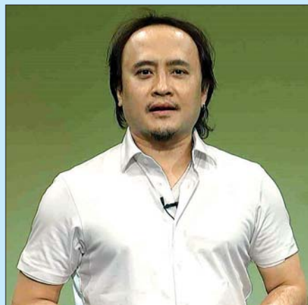
ဇော်ပိုင်

ကမ္ဘာတစ်ဝန်း ကိုဗစ်-၁၉ ကူးစက်ပျံ့နှံ့မှုသည် မြန်မာနိုင်ငံအတွက် မြန်မာနိုင်ငံ၌ အစိုးရအဖွဲ့အစည်းများက ကာကွယ်၊ ထိန်းချုပ်၊ ကုသရေးလုပ်ငန်းစဉ်များကို အရှိန်အဟုန်ဖြင့် ဆောင်ရွက်လျက်ရှိပြီး ကျန်းမာရေးဝန်ထမ်းများ၊ သက်ဆိုင်ရာဒေသများရှိ အရပ်ဘက်အဖွဲ့အစည်းများက ကျန်းမာရေးအသိပညာပေး နှိုးဆော်ရေးအစီအစဉ်များတွင် ပူးပေါင်းပါဝင်ဆောင်ရွက်ခဲ့ကြပါသည်။ ထို့အတူ ဂီတ၊ ရုပ်ရှင် အနုပညာရှင်များကလည်း ကိုဗစ်-၁၉ နှင့် ပတ်သက်၍ အသိပညာပေးနှိုးဆော်ရေးအစီအစဉ်တွင် ပါဝင်ခဲ့ကြပါသည်။