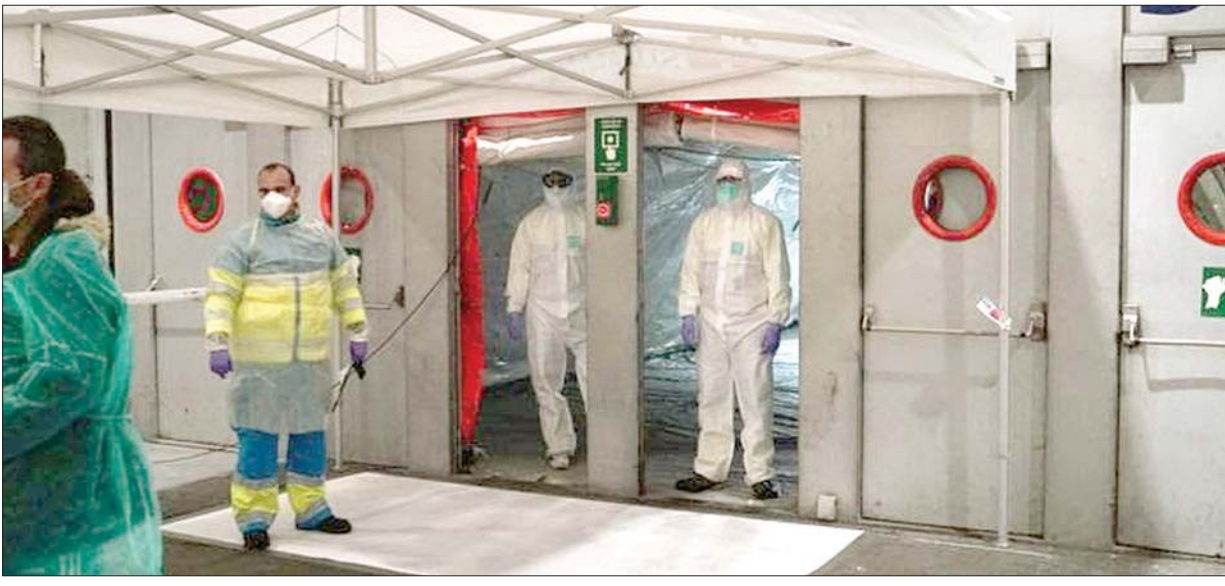
စပိန်နိုင်ငံ မက်ဒရစ်ဆေးရုံ၌ ကျန်းမာရေးဝန်ထမ်းများ တာဝန်ဆောင်ရွက်နေကြစဉ်။

စပိန်ဆေးရုံတွေရဲ့ အထူးကြပ်မတ်ကုသဆောင်တွေအပေါ်မှာ ကျရောက် နေတဲ့ဖိအားဟာ စပိန်ရဲ့ အကြီးဆုံးစိန်ခေါ်မှုတစ်ခုဖြစ်လျက်ရှိတယ်လို့ နိုင်ငံ ခြားရေးဝန်ကြီးက ပြောပါတယ်။ ယနေ့မှာ အသစ်ချမှတ်လိုက်တဲ့ စည်းကမ်း