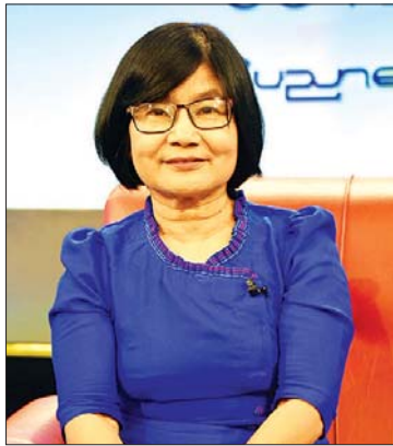
စာရေးဆရာမ ဂျူး