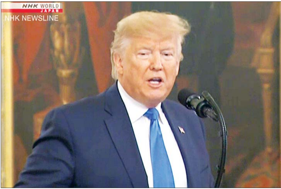
အမေရိကန်သမ္မတဒေါ်နယ်ထရမ်

သမ္မတ၏တောင်းဆိုမှုကြောင့် ရောဂါထိန်းချုပ်ရေးနှင့် ကာကွယ်ရေး ဌာနက ခရီးသွားလာရာတွင် လိုက်နာ သင့်သည့် အကြံပြုချက်များ