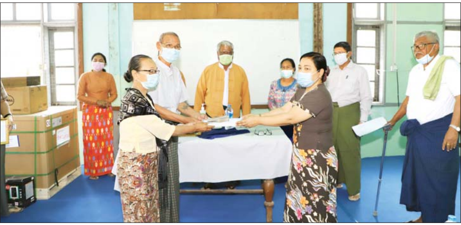
ရွှေဘိုခရိုင် ပြည်သူ့ကျန်းမာရေးဦးစီးဌာန၌ COVID - 19 ရောဂါ ကာကွယ်၊ ကုသရေးအတွက် အသုံးပြုရန် အလှူငွေ များ ပေးအပ်လှူဒါန်းစဉ်။

ဆေးရုံအုပ်ကြီးက ကိုရိုနာဗိုင်းရပ်စ်ကာကွယ်ရေးလုပ်ငန်း များ ဆောင်ရွက်နေမှုနှင့် လိုအပ်ချက်များကို တင်ပြပြီး အလှူရှင်များ၏ လှူဒါန်းငွေကျပ် ၃၅၄ သိန်းနှင့် ကျန်းမာရေးသုံးပစ္စည်းများ တန်ဖိုးငွေကျပ်သိန်း ၅၀၀ တို့ကို လက်ခံရယူခဲ့ကာ အလှူရှင်များအား ဂုဏ်ပြု မှတ်တမ်းလွှာများ ပြန်လည်ပေးအပ်ခဲ့သည်။ အလားတူ တိုင်းဒေသကြီးဝန်ကြီးချုပ်နှင့်အဖွဲ့သည် ယနေ့ နံနက် ၈ နာရီခွဲက ကျောင်းမြောင်းမြို့နယ်အတွင်းရှိ ကျောင်းမြောင်း-စဉ့်ကူး ဧရာဝတီမြစ်ကူး ရတနာသိင်္ဃ တံတား ကိုရိုနာဗိုင်းရပ်စ်ကြိုတင်ကာကွယ်ရေး၊ စစ်ဆေး ရေး ဂိတ်တွင် ကြည့်ရှုစစ်ဆေးပြီး လိုအပ်သည့် ဆေးဝါး များနှင့် အလှူငွေများကို ထောက်ပံ့ပေးအပ်ခဲ့ကာ ကျောင်းမြောင်း တိုက်နယ်ဆေးရုံရှိ ကျန်းမာရေးဝန်ထမ်း များနှင့် ပြည်သူများအား တွေ့ဆုံ၍ ဆွေးနွေးမှာကြားခဲ့ ကြောင်း သိရသည်။