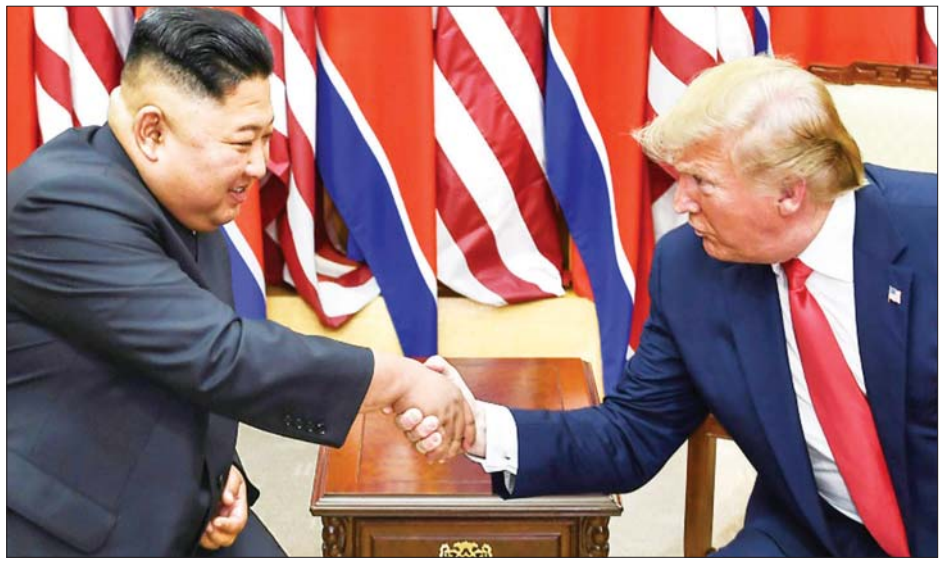
၂၀၁၉ ခုနှစ် ဇွန် ၃၀ ရက်က မြောက်ကိုရီးယားနှင့် တောင်ကိုရီးယားစစ်မဲ့စုန့်တွေ့ဆုံပွဲတွင် မြောက်ကိုရီးယား ခေါင်းဆောင် ကင်ဂျုံအန်းနှင့် အမေရိကန်သမ္မတဒေါ်နယ်ထရမ်တို့ကို တွေ့ရစဉ်။

နျူကလီးယားလက်နက်ပိုင်ဆိုင်သော မြောက် ကိုရီးယားနိုင်ငံသည် တနင်္ဂနွေနေ့က ခုံးကျည်ပစ်လွှတ်မှု အတွက် မည်သည့်ထုတ်ပြန်ချက်မျှ ထုတ်ပြန်ကြေညာ ခြင်းမရှိသေးကြောင်း သိရသည်။ အေအက်မ်ပီ