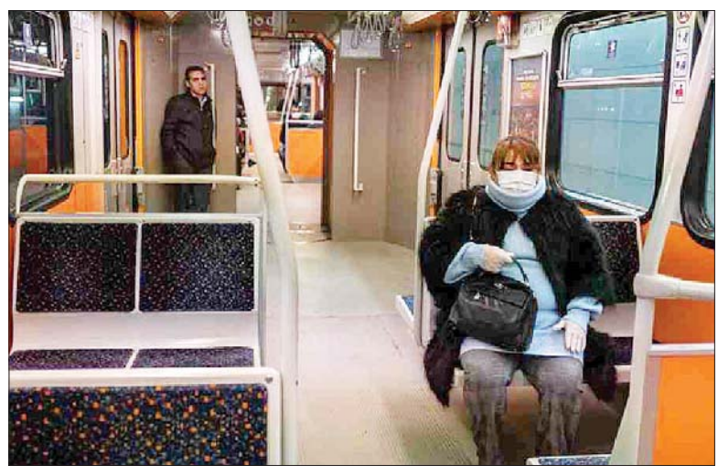
တူရကီရှိ အများပြည်သူသယ်ယူပို့ဆောင်ရေးယာဉ်ပေါ်တွင် လူအနည်းငယ်သာ လိုက်ပါစီးနင်းမှုကို တွေ့ရစဉ်။

အန်ကာရာ မတ် ၂၉ တူရကီနိုင်ငံ၌ ပြီးခဲ့သည့် တစ်ရက်အတွင်း ကိုရိုနာဗိုင်းရပ်စ်ကူးစက်ခံရသည့်လူနာ ၁၆ ဦးထပ်မံသေဆုံးခဲ့ရာ သေဆုံးသူအရေအတွက် ၁၀၈ ဦးဖြစ်လာခဲ့ကြောင်း တူရကီကျန်းမာရေးဝန်ကြီး ဖာရက်တီကိုကာက မတ် ၂၈ ရက်ညပိုင်းက ပြောကြားခဲ့သည်။