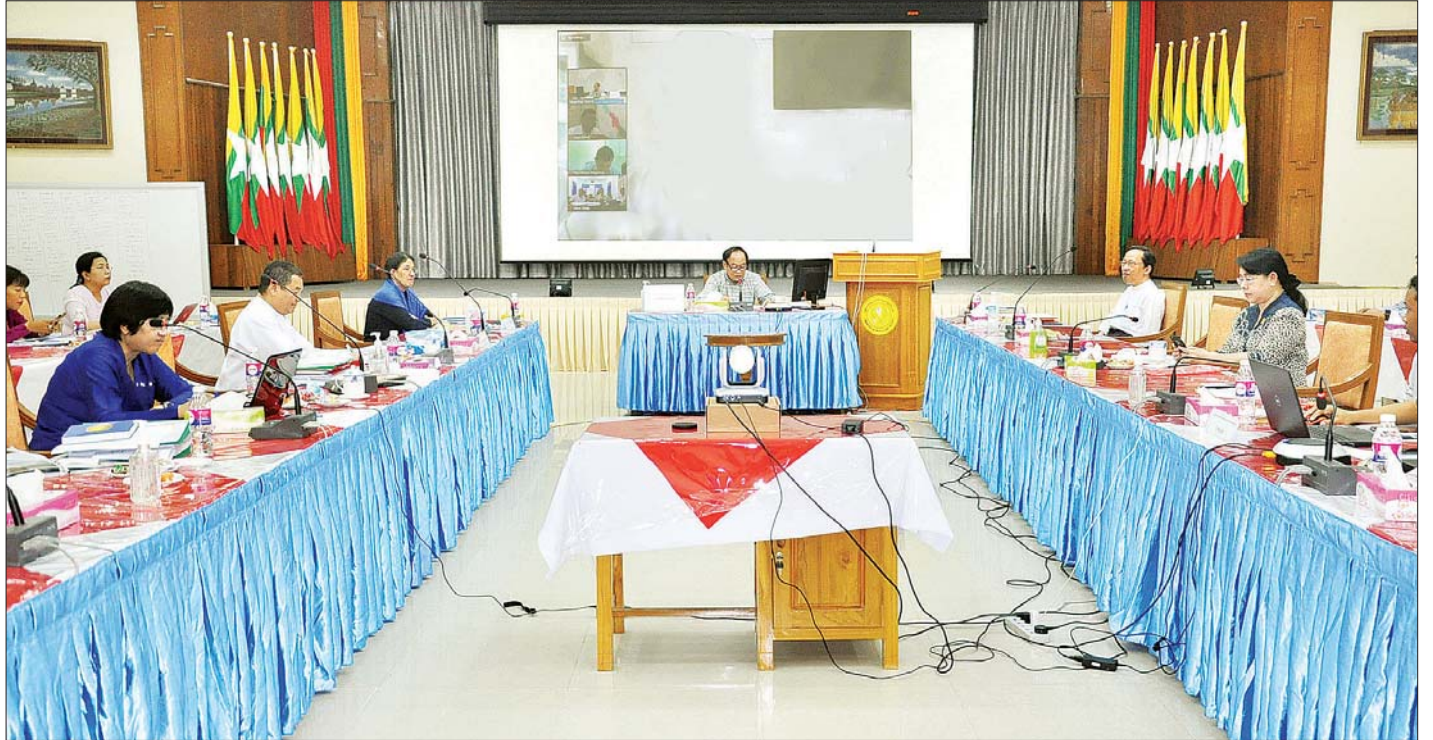
အင်တာနက်ကွန်ရက်အသုံးပြု Video Conferencing ပုံစံဖြင့် ပြုလုပ်သော COVID-19 ရောဂါကာကွယ်ထိန်းချုပ်ရေး ဗဟိုအဆင့်လုပ်ငန်းညှိနှိုင်းအစည်းအဝေး (၄၄/၂၀၂၀) ကျင်းပစဉ်။