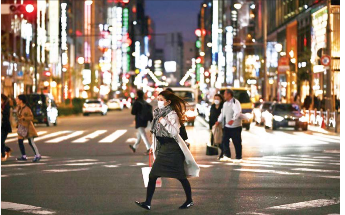
တိုကျိုမြို့၌ ညအချိန် နှာခေါင်းစည်းတပ်ဆင်သွားလာသူအချို့ကို တွေ့ရစဉ်။