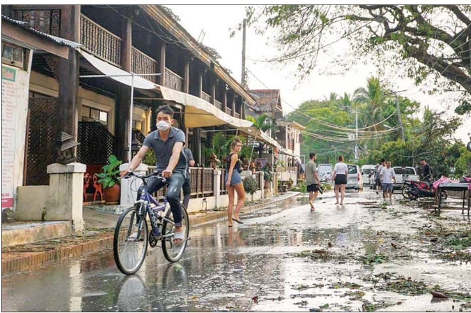
ကပ်ရောဂါဖြစ်ပွားမှုကြောင့် ခရီးသွားလာမှုကန့်သတ်ချက်ထုတ်ပြန်ထားသည့် လောင်ပရာဘန်မြို့တွင် ဒေသခံအချို့ကို တွေ့ရစဉ်။

ကိုရိုနာဗိုင်းရပ်စ် တားဆီးကာကွယ်ရေးနှင့် ထိန်းချုပ်ရေးလုပ်ငန်းဆောင်ရွက်မှု ကော်မတီဥက္ကဋ္ဌအဖြစ် ဆောင်ရွက်နေသည့် လာအိုဒုတိယဝန်ကြီးချုပ် ဆွမ်ဒီဒေါင်ဒီနှင့် လာအိုနိုင်ငံဆိုင်ရာ တရုတ်သံအမတ်ကြီး ကျီအန်ကျင်ဒေါင်တို့သည် ဗီယန်ကျင်းမြို့ ဝပ်တေးနိုင်ငံတကာလေဆိပ်၌ တရုတ်ဆေးဘက်ကျွမ်းကျင်ပညာရှင်များအဖွဲ့ကို ကိုယ်တိုင်သွားရောက် ကြိုဆိုခဲ့ကြသည်။