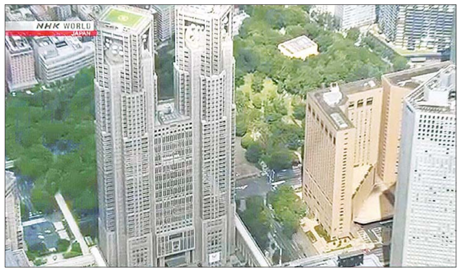
တိုကျိုမြို့မြင်ကွင်းကို တွေ့ရစဉ်။ အင်နီအိတ်ချ်ကေ

တိုကျိုမြို့သည် ကိုရိုနာဗိုင်းရပ်စ် ကပ်ရောဂါ အဆိုးရွားဆုံးဖြစ်နေ သည့်နေရာတစ်ခုဖြစ်ပြီး အဆမတန် ဖြစ်ပွားမှုကို တားဆီးရန် ကြိုးစား ဆောင်ရွက်လျက်ရှိကြောင်း သိရ သည်။ အင်နီအိတ်ချ်ကေ