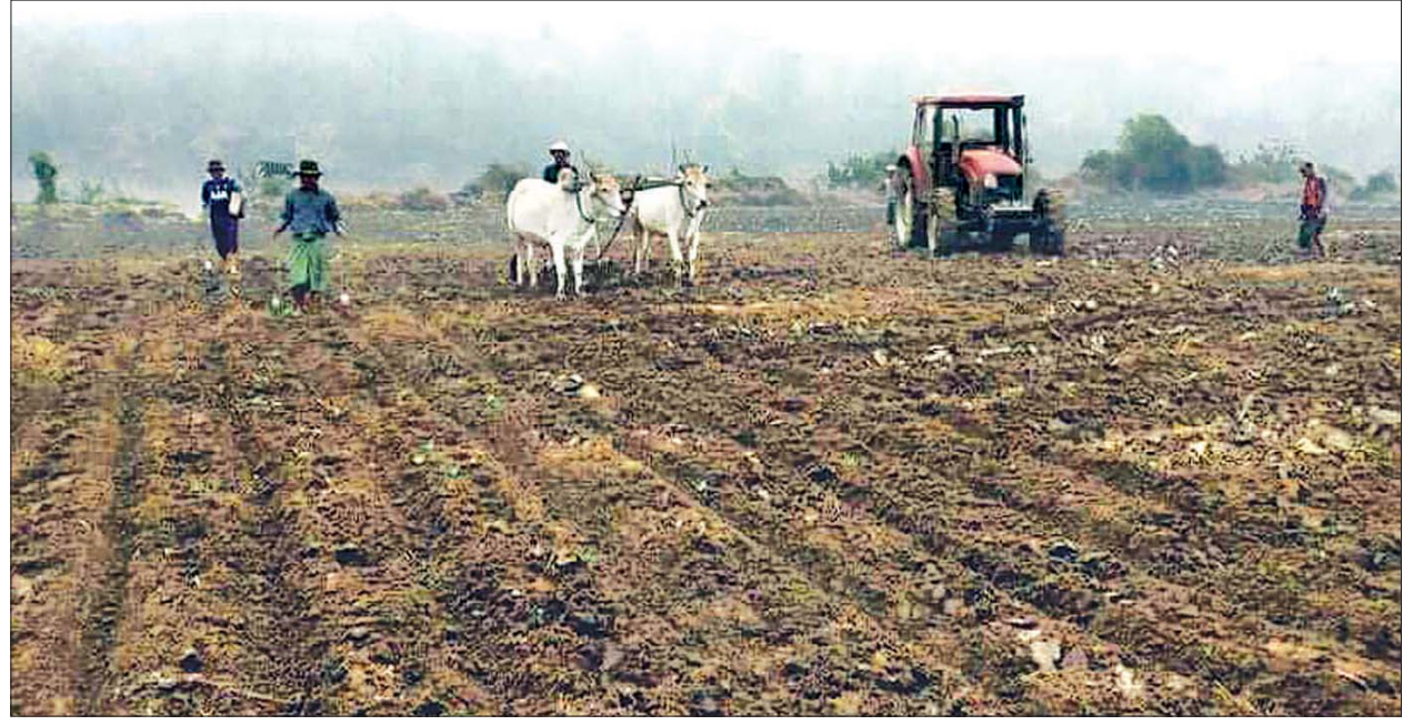
ဂန့်ဂေါဒေသတွင် နွေနှမ်းသီးနှံစိုက်ပျိုးနေသည့် လုပ်ငန်းခွင်။

မြို့နယ်ဦးစီးမှူး၏ မျိုးစေ့နှင့် ဓာတ်မြေဩဇာထောက်ပံ့မှုတို့ဖြင့် ချောင်းနက် ကျေးရွာတွင် နွေနှမ်း လေးစကကို ရေစုပ်စက်ဖြင့် ရေတင်၍ စမ်းသပ်စိုက် ပျိုးထားခြင်းဖြစ်ကြောင်း သိရသည်။ စိုက်ပျိုးသည့်မျိုးများမှာ ဆင်းရတနာ(၃) နှင့် ဆင်းရတနာ (၁၄) မျိုးများ ဖြစ်ကာ အဆိုပါမျိုးများ၏ ဖြစ်ထွန်းအောင်မြင်နိုင်မှုနှင့် ဒေသနှင့်ကိုက်ညီမှု ရှိမရှိတို့ကိုပါ သိရှိနိုင်ရန် စမ်းသပ်စိုက်ပျိုးထားခြင်းဖြစ်ကြောင်း မြို့နယ် စိုက်ပျိုးရေးဦးစီးဌာနမှ တာဝန်ရှိသူတစ်ဦးက ပြောသည်။ ၁၄၄