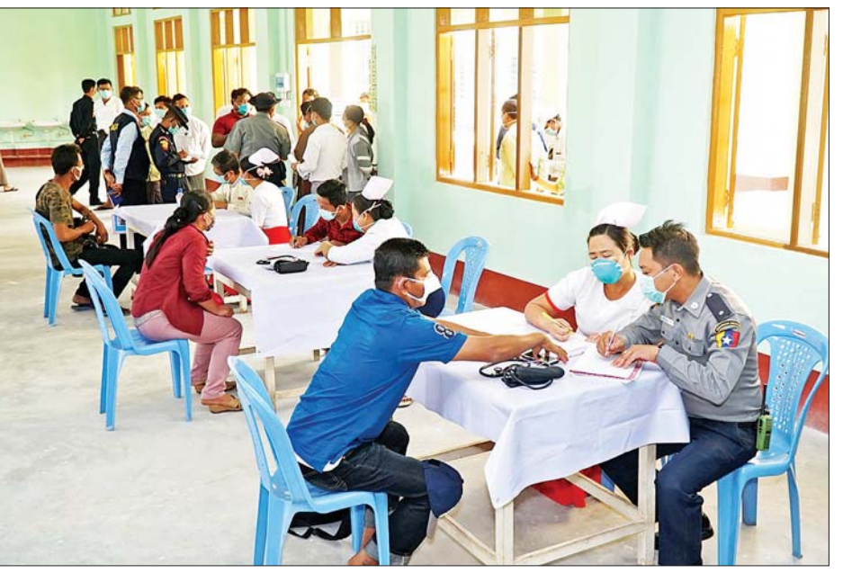
အသွားအလာ ကန့်သတ်စောင့်ကြည့်ခံရသူများအား ကျန်းမာရေးဆေးစစ်မှုများ ဆောင်ရွက်ပေးစဉ်။

တိုင်းဒေသကြီး လူမှုဝန်ထမ်းဦးစီးဌာန တို့ပူးပေါင်း၍ အသက်ရှူလမ်းကြောင်း ဆိုင်ရာရောဂါ ကာကွယ်ရေးအတွက် လိုက်နာဆောင်ရွက်ရမည့် အချက်များအား မကွေးမြို့ပေါ်ရပ်ကွက်များ၊ အောင်မေတ္တာ ရပ်ကွက် (A) (B) (C) ရပ်ကွက်အတွင်းရှိ ပြည်သူများသို့ ကားဖြင့် လိုက်လံအသိပညာပေးပြောကြားခြင်း၊ ပုဂ္ဂလိကပိုင်လုပ်ငန်း သုံးမော်တော်ယာဉ်များ ကြီးကြပ်မှုကော်မတီနှင့် ရောင်စုံမေတ္တာလူမှုကယ်ဆယ်ရေးအဖွဲ့တို့ ပူးပေါင်းကာ မော်တော်ယာဉ်ဂိုတံ၊ ကားကြီးကွင်းနှင့် မော်တော်ယာဉ်များအား ပိုးသတ်ဆေးဖျန်းခြင်း၊ ကြက်ခြေနီ၊ မီးသတ်နှင့် ကျန်းမာရေးစောင့်ရှောက်ရေး အသင်းအဖွဲ့များက COVID-19 ရောဂါ ပြန့်ပွားမှုမရှိစေရေး အသိပညာပေးခြင်း လုပ်ငန်းများ ပူးပေါင်းဆောင်ရွက် လျက်ရှိကြောင်း သိရသည်။ သန်းနိုင်ဦး(ဇပဲ)