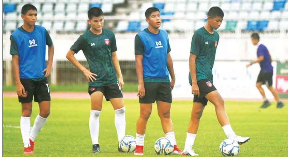
နိုင်ငံတကာပြိုင်ပွဲများအတွက် လေ့ကျင့်ပြင်ဆင်နေသည့် မြန်မာ ယူ-၁၆ အသင်းအား တွေ့ရစဉ်။

ရန်ကုန် မတ် ၂၉ အာဆီယံ ဘောလုံးအဖွဲ့ချုပ်သည် ဩဂုတ်လအထိ ကျင်းပမည့် အာဆီယံ အဆင့် (AFF) ပြိုင်ပွဲ အားလုံးကို ကမ္ဘာနိုင်ငံများတွင် ဖြစ်ပွားနေသည့် COVID-19 ရောဂါကြောင့် ရွှေ့ဆိုင်း လိုက်ပြီဖြစ်သည်။ အာဆီယံ ဘောလုံးအဖွဲ့ချုပ် သည် ယခုနှစ်အတွင်း ပြိုင်ပွဲ ကိုးခု ကျင်းပရန် စီစဉ်ထားပြီး မေလမှ ဩဂုတ်လအထိ ကျင်းပရန် စီစဉ်ထား မြင်းဖြစ်သည်။ အာဆီယံ ဘောလုံးအဖွဲ့ ချုပ်သည် ယခုနှစ်အတွင်း ပထမဆုံး အဖြစ် မေလတွင် ကျင်းပမည့် အာဆီယံ အမျိုးသမီးပြိုင်ပွဲအပါအဝင် စာမျက်နှာ ၁၀ ကော်လံ ၅