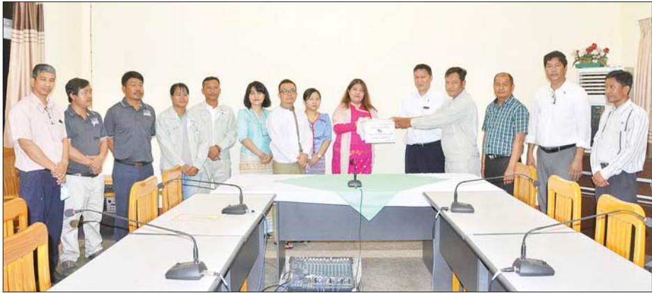
မြောက်ဥက္ကလာပ ပြည်သူ့ဆေးရုံကြီး၌ အသုံးပြုရန် အသက်ရှူစက် တစ်လုံးနှင့် ဆက်စပ်ပစ္စည်းများ ပေးအပ် လှူဒါန်းစဉ်။