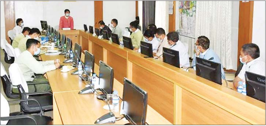
ခေတ္တဝန်ကြီးချုပ် ဦးဇော်အောင် မန္တလေးတိုင်းဒေသကြီးအတွင်းရှိ လုပ်ငန်းရှင်များနှင့် တွေ့ဆုံဆွေးနွေးစဉ်။

မန္တလေး မတ် ၂၉ မန္တလေးတိုင်းဒေသကြီး အစိုးရအဖွဲ့ အနေဖြင့် လူစုလူဝေးရှောင်ရှားနိုင်ရေး စီမံဆောင်ရွက်ထားရှိပြီး အခြေခံစားသောက်ကုန်များကို COVID-19 ရောဂါပိုးကူးစက်ပျံ့နှံ့မှု အခြေအနေပေါ်မူတည်၍ အခြေခံစားသောက်ကုန်များ လုံလောက်စွာရရှိနိုင်ရေး ဆောင်ရွက် ပေးသွားရန်စီစဉ်ထားကြောင်း မတ် ၂၈ ရက် နံနက်ပိုင်းက တိုင်းဒေသကြီး အစိုးရအဖွဲ့ရုံးတွင် ပြုလုပ်သည့် COVID-19 ရောဂါကာကွယ်၊ ထိန်းချုပ်၊ ကုသရေးနှင့် ပတ်သက်၍ မန္တလေးတိုင်း ဒေသကြီး ဆန်ကုန်သည့်များအသင်း၊ ဆီစက်ပိုင်ရှင်များအသင်း၊ မြန်မာနိုင်ငံမွေးမြူရေးလုပ်ငန်း အဖွဲ့ချုပ်တို့နှင့် လုပ်ငန်းညှိနှိုင်းအစည်းအဝေးမှ သိရသည်။ “အကယ်၍ ရောဂါပိုးကူးစက်ပျံ့နှံ့မှုအရ လုပ်ငန်းများရပ်ဆိုင်းထားရတဲ့ ကာလရောက်ရှိခဲ့သော် အစိုးရအနေနဲ့ အခြေခံစားသောက်ကုန်များကို အခမဲ့ထောက်ပံ့ခြင်း သို့မဟုတ်