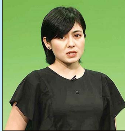
ရွှေသမီး

ကမ္ဘာတစ်ဝန်း COVID-19 ကူးစက်ပျံ့နှံ့မှုသည် မြန်မာနိုင်ငံအတွက် မြန်မာနိုင်ငံ၌ အစိုးရအဖွဲ့အစည်းများက ကာကွယ်၊ ထိန်းချုပ်၊ ကုသရေးလုပ်ငန်းစဉ်များကို အရှိန်အဟုန်မြှင့် ဆောင်ရွက်လျက်ရှိပြီး ကျန်းမာရေးဝန်ထမ်းများ၊ သက်ဆိုင်ရာဒေသများရှိ အရပ်ဘက်အဖွဲ့အစည်းများက ကျန်းမာရေးအသိပညာပေး နှိုးဆော်ရေးအစီအစဉ်များတွင် ပူးပေါင်းပါဝင်ဆောင်ရွက်ခဲ့ကြပါသည်။ ထို့အတူ ဂီတ၊ ရုပ်ရှင် အနုပညာရှင်များကလည်း COVID-19 နှင့် ပတ်သက်၍ အသိပညာပေးနှိုးဆော်ရေးအစီအစဉ်တွင် ပါဝင်ခဲ့ကြပါသည်။