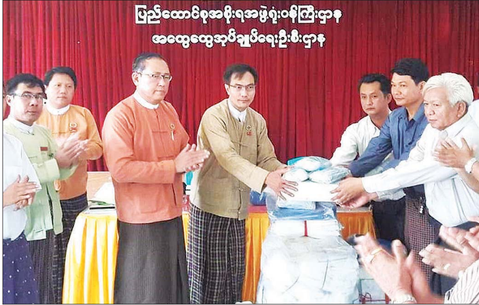
ပြည်ထောင်စုအစိုးရအဖွဲ့ရုံးဝန်ကြီးဌာန အထွေထွေအုပ်ချုပ်ရေးဦးစီးဌာန