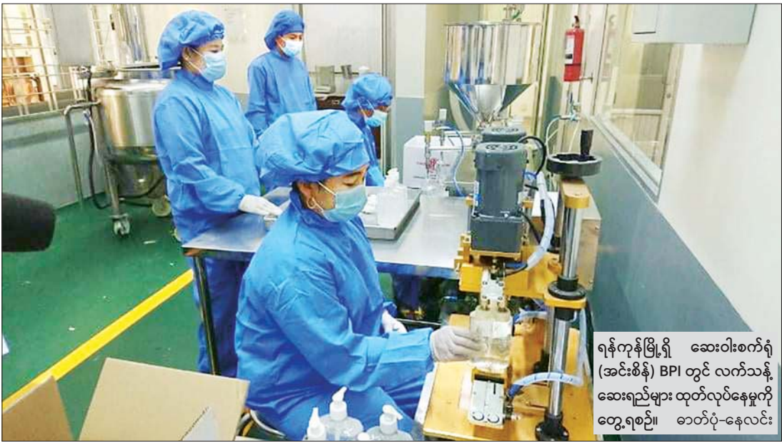
ရန်ကုန်မြို့ရှိ ဆေးဝါးစက်ရုံ (အင်းစိန်) BPI တွင် လက်သန့်ဆေးရည်များ ထုတ်လုပ်နေမှုကို တွေ့ရစဉ်။

နေပြည်တော် မတ် ၂၉ ကျန်းမာရေးနှင့် အားကစားဝန်ကြီးဌာန ပြည်ထောင်စုဝန်ကြီး ဒေါက်တာမြင့်ထွေးသည် ယနေ့ မွန်းလွဲ ၁ နာရီတွင် နေပြည်တော်ရှိ ကျန်းမာရေးနှင့် အားကစားဝန်ကြီးဌာန အစည်းအဝေးခန်းမ၌ အင်တာနက်ကွန်ရက်အသုံးပြု Video Conferencing ပုံစံဖြင့် ပြုလုပ်သော COVID-19 ရောဂါကာကွယ်ထိန်းချုပ်ရေး ဗဟိုအဆင့်လုပ်ငန်းညှိနှိုင်းအစည်းအဝေး (၄၄/၂၀၂၀) သို့ တက်ရောက်သည်။ အစည်းအဝေး၌ ပြည်ထောင်စုဝန်ကြီးက COVID-19 ရောဂါကာကွယ်ထိန်းချုပ်ရေးလုပ်ငန်းများကို အားသွန်ခွန်စိုက် ပြုလုပ်လျက်ရှိသော ပြည်သူ့ကျန်းမာရေး၊ ကုသရေး၊ ဓာတ်ခွဲကဏ္ဍအသီးသီးမှ ဝန်ထမ်းများအားလုံးကို ပြည်သူများကိုယ်စား ကျေးဇူးတင်ရှိကြောင်း၊ ယခုကဲ့သို့ Video Conferencing ဖြင့် တိုင်းဒေသကြီး/ပြည်နယ်စာမျက်နှာ ၄ ကော်လံ ၁