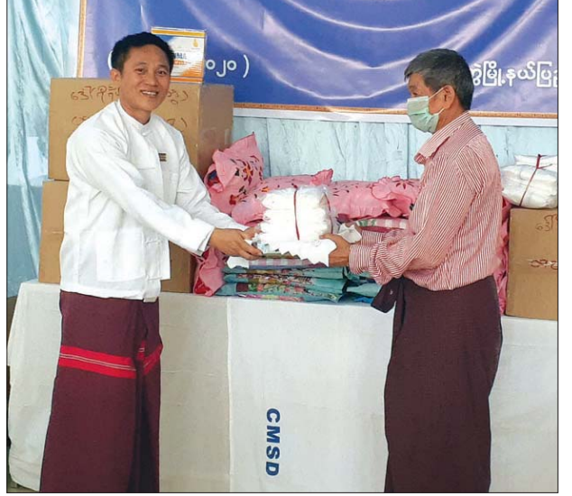
COVID-19 ရောဂါ ကြိုတင်ကာကွယ်ရန်အတွက် အလှူငွေပေးအပ်စဉ်။

ကာကွယ်မှု လုပ်ထားမှထိရောက်မှာပါ။ ဒါပေမယ့် မြို့တွင်းနေရာအနှံ့ ပိုးသတ်ဆေးဖျန်းမယ်ဆိုပါက ဆေးလိုအပ်ချက်ရှိတယ်ဆိုပေမယ့် လက်ရှိမှာတော့ အလှူရှင်တွေက ဆေးပိုးနဲ့ အလှူငွေလာရောက် လှူဒါန်းတာရှိပါတယ်။ အလှူငွေတွေနဲ့ ပိုးသတ်ဆေးလည်း ထပ်တိုးမှာထားတယ်။ အခုလို ဆောင်ရွက်နိုင်အောင်လည်း အလှူရှင်တွေရဲ့ ဆေးပိုးနဲ့ အလှူငွေထည့်ပင်လှူဒါန်းမှုတို့နဲ့ ဆောင်ရွက်တာဖြစ်ပြီး အလှူငွေတွေနဲ့ ပိုးသတ် ဆေးတွေ ထပ်မံယူကာ ပိုးသတ်ဆေး ဆက်လက် ပက်ဖျန်းပေးမှာ ဖြစ်ပါတယ်။ ပိုးသတ်ဆေးဖျန်းဖို့ လှူဒါန်းသလို တစ်ကိုယ်ရေ ရောဂါကာကွယ်ရေး ဝတ်စုံတွေလည်း လုံလုံလောက်လောက်ဖြစ်အောင် လှူဒါန်းပေးစေချင်တယ်။ တစ်ကိုယ်ရေ ရောဂါကာကွယ်ရေးဝတ်စုံက ပိုအရေးကြီးတယ်” ဟု မီးသတ်ဦးစီးမှူး ဦးရန်ပိုင်မြို့က ပြောသည်။ သန်းသန်း (ရေဦး)