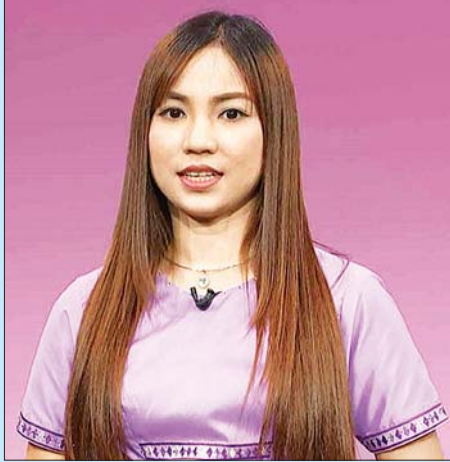
နန့်ချစ်နဒီဇော်

ကိုရိုနာဗိုင်းရပ်စ်ဗိုင်းဟာ အသက်ရှူလမ်းကြောင်းကတစ်ဆင့် ကူးစက်တတ်တဲ့ရောဂါတစ်မျိုးဖြစ်ပြီး ရောဂါရှိတဲ့သူ နှာချေ၊ ချောင်းဆိုးရာကတစ်ဆင့် ထွက်လာတဲ့ ရောဂါပိုးပါဝင်နေတဲ့ အစက်အမှုန်တွေက အသက်ရှူလမ်းကြောင်းကနေ တိုက်ရိုက် ဝင်ရောက်သွားလို့ ကူးစက်နိုင်သလို -