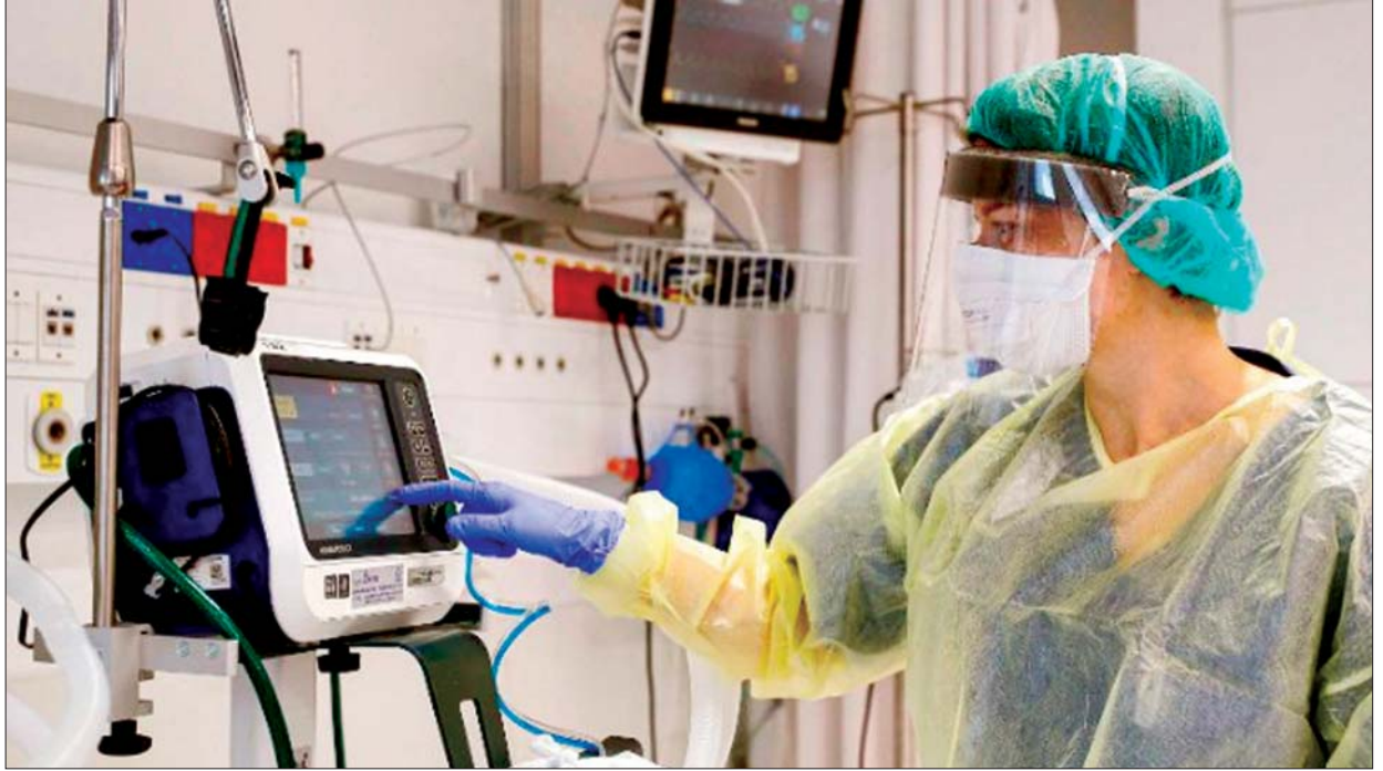
အမေရိကန်၌ အသက်ရှူစက်အသုံးပြုနေသည့် ကျန်းမာရေးဝန်ထမ်းတစ်ဦးကိုတွေ့ရစဉ်။

အခွန်ထမ်းသူတွေကို အမေရိကန်ဒေါ်လာ တစ်ဘီလီယံပေးအပ်မယ့် ဥပဒေကို သမ္မတထရမ်ရဲ့ အစိုးရအဖွဲ့အရာရှိတွေက နှောင့်ယှက်ဟန့်တားမှု မလုပ်ခင် လာမယ့်ဧပြီလမှာ ကုမ္ပဏီနှစ်ခုအကြား စီးပွားရေးပူးပေါင်း ဆောင်ရွက်မှုကို အိမ်ဖြူတော်က ကြေညာဖို့လုပ်ထားတာဖြစ်ပါတယ်။ ဈေးနှုန်းနဲ့ပတ်သက်ပြီးတော့ ကျွန်ုပ်တို့အနေနဲ့ ငွေကြေးခေါင်းပုံဖြတ်ခံရတာမျိုး မလိုလားဘူးလို့ သမ္မတထရမ်က ပြောကြားခဲ့ပါတယ်။