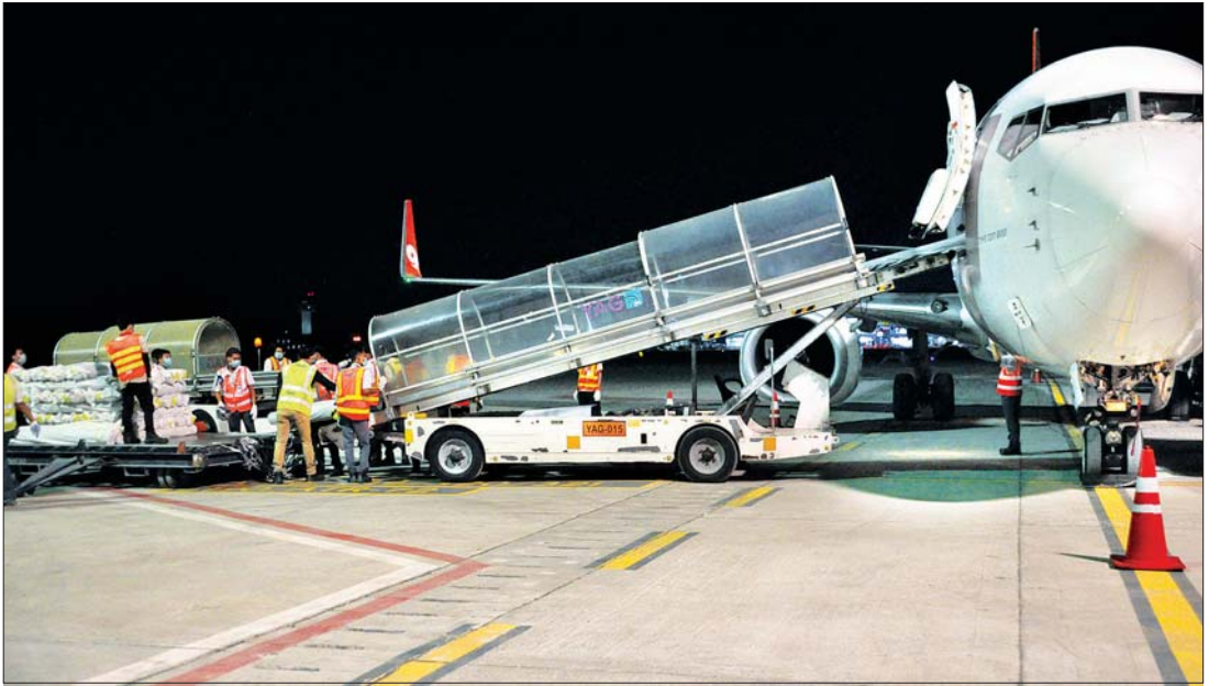
မြန်မာနိုင်ငံရှိ အထည်ချုပ်စက်ရုံများအတွက် တရုတ်ပြည်သူ့သမ္မတနိုင်ငံ ကွမ်ကျိုးမြို့မှ AQ - 1359 Cargo ကုန်တင်လေယာဉ်ဖြင့် သယ်ဆောင်လာသည့် ကုန်ကြမ်းပစ္စည်းများ ရန်ကုန်အပြည်ပြည်ဆိုင်ရာလေဆိပ်သို့ ရောက်ရှိလာစဉ်။