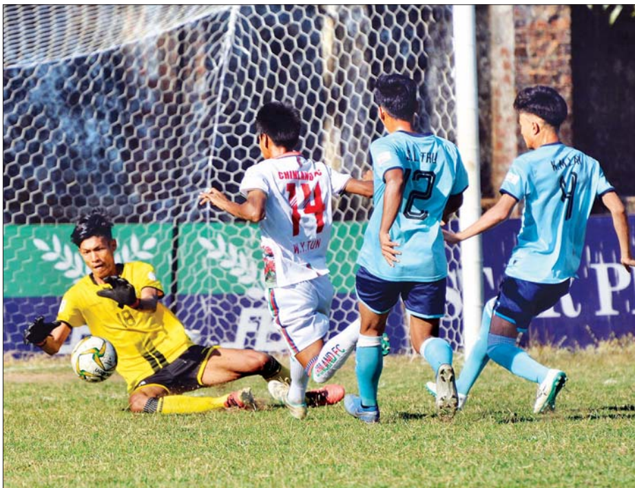
Chinland အသင်းနှင့် ငွေကြယ်ပွင့်အသင်းတို့ ယှဉ်ပြိုင်နေစဉ်။

ဒုတိယနေ့တွင် Chinland အသင်းက ငွေကြယ်ပွင့်အသင်းကို ငါးဂိုး-ဂိုးမရှိ၊ ဇွဲကပင်အသင်းက မောရဝတီအသင်းကို ငါးဂိုး-ဂိုးမရှိ၊ အား/ကာသိပွဲအသင်းက Southern အသင်းကို နှစ်ဂိုး-ဂိုးမရှိဖြင့် အနိုင်ရခဲ့သည်။ ယခုရာသီတွင် ရလဒ်ကောင်းများရနေသည့် Chinland အသင်းသည် ငွေကြယ်ပွင့်အသင်းကို ရိုးပြတ်အနိုင်ယူကာ နိုင်ပွဲဆက်ခဲ့ပြီး အဆင့် ၆ နေရာတွင် ဆက်လက်ရပ်တည်နိုင်ခဲ့သည်။ Chinland အသင်းသည် ပထမပိုင်းတွင် နှစ်ဂိုးသာ သွင်းယူနိုင်သော်လည်း ဒုတိယပိုင်းတွင် သုံးဂိုး ထပ်မံသွင်းယူကာ စာမျက်နှာ ၁၂ ကော်လံ ၅ ၀