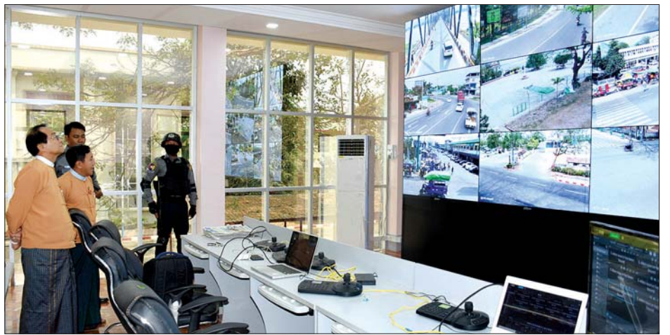
ပြည်နယ်ဝန်ကြီးချုပ် ဒေါက်တာခက်အောင် လုံခြုံရေးကင်မရာ တပ်ဆင်ထားမှုများကို ကြည့်ရှုစစ်ဆေးစဉ်။