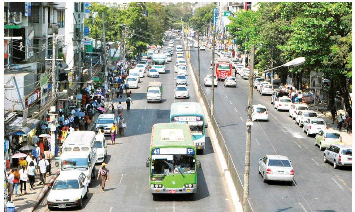
အင်းစိန်လမ်းတစ်လျှောက်ပြေးဆွဲနေသော YBS ယာဉ်များကို တွေ့ရစဉ်။

ထို့ပြင် ရန်ကုန်တိုင်းဒေသကြီးအတွင်းရှိ တက္ကသိုလ်ကျောင်းသား ကျောင်းသူများအနေဖြင့် မတ်လအတွင်း ကျင်းပမည့် စာမေးပွဲကာလအတွင်း သွားလာမှုအဆင်ပြေချောမွေ့စေရေးအတွက် ရန်ကုန်တိုင်းဒေသကြီး သယ်ယူပို့ဆောင်ရေး ကြီးကြပ်ကွပ်ကဲမှု အာဏာပိုင်အဖွဲ့ (YRTA) အနေဖြင့် စီမံချက်များ ချမှတ်ထားပြီးဖြစ်ကြောင်း သိရသည်။