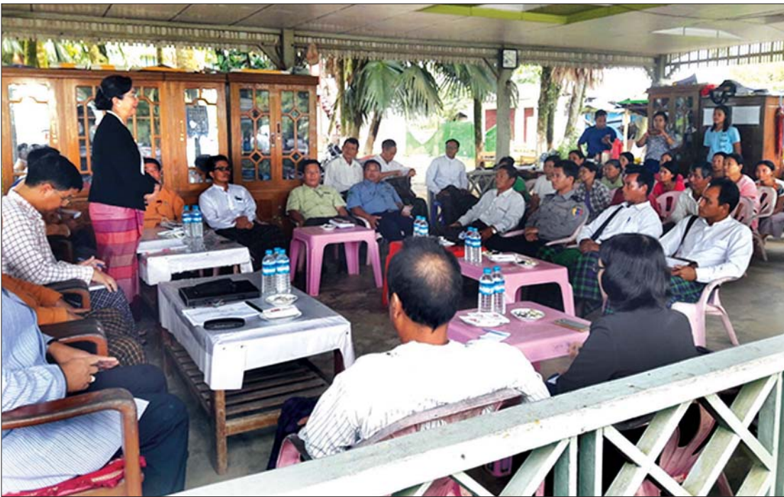
အမျိုးသားလွှတ်တော် တိုင်းရင်းသားရေးရာကော်မတီက ကချင်ပြည်နယ် တနိုင်းမြို့ တိမ်းရှောင်စခန်းသို့ ကွင်းဆင်းလေ့လာစဉ်။

အခြားအဖွဲ့အစည်းတွေကလည်း တွေ့ဆုံ ဆွေးနွေးကြပါတယ်။ အချို့တိုင်းရင်းသား တွေ ကျတော့ စာပေတွေ သင်ကြားဖို့ ကျောင်းတွေမှာ ပြဋ္ဌာန်းစာအုပ် မလုပ်ရ သေးပါဘူး။ အဲဒီလို လုပ်ဆောင်ဖို့ ကျွန်တော်တို့ ကော်မတီက နည်းလမ်းတွေ အကြံပြုတာတွေလည်း ရှိပါ တယ်။ ပညာရေးဝန်ကြီးဌာနကလည်း တိုင်း ရင်းသားစာပေ ပြဋ္ဌာန်းစာအုပ်တွေ ထုတ်နိုင်ဖို့ ဆောင်ရွက်ပေးနေတာတွေ ရှိပါတယ်။ ကျွန်တော်တို့ အဲဒီလို တိုင်းရင်း သားတွေနဲ့ ပတ်သက်တဲ့ ဘာသာ၊ စာပေ၊ စကား၊ ရိုးရာ ယဉ်ကျေးမှုနဲ့ ပတ်သက်တဲ့ အခက်အခဲတွေ တင်ပြလာရင် သက်ဆိုင်ရာ ဝန်ကြီးဌာနတွေနဲ့ ပေါင်းစပ်ညှိနှိုင်း ဆောင်ရွက်ပေးပါတယ်။ တိုင်းရင်းသား ဒေသအသီးသီးက တင်ပြချက်တွေကို သက်ဆိုင်ရာဝန်ကြီးဌာနတွေနဲ့ ချိတ်ဆက် ဆောင်ရွက်ပေးပါတယ်။ တိုင်းရင်းသားတွေရဲ့ ပညာရေးကဏ္ဍနဲ့ ပတ်သက်ပြီးတော့လည်း တိုးတက်အောင် ဆောင်ရွက်ဖို့ တိုင်းရင်းသားပညာရေးကို ထောက်ပံ့နေတဲ့အဖွဲ့အစည်း ယူနီဆက်ဖ်နဲ့ ချိတ်ဆက်ဆောင်ရွက်ဖို့ အစီအစဉ်တွေ ရှိပါတယ်။ ကျွန်တော်တို့ တိုင်းရင်းသားရေးရာ ကော်မတီအနေနဲ့ တိုင်းရင်းသားတွေရဲ့ ဘာသာ၊ စာပေ၊ စကား၊ ရိုးရာယဉ်ကျေးမှုတွေ နဲ့ပတ်သက်ပြီး ပေါင်းစပ်ဆောင်ရွက်ပေး လျက်ရှိပါတယ်။ ရှေ့ဆက်လက်ပြီးတော့ လည်း ကရင်ပြည်နယ်၊ မွန်ပြည်နယ်တွေကို သွားရောက်ပြီး ဆောင်ရွက်ဖို့ရှိပါတယ်။ တိုင်းရင်းသားတွေရဲ့ မြေမူဝါဒရေးဆွဲရာ မှာလည်း အထောက်အကူပြုအောင် သုတေ သနလုပ်ငန်းတွေ ဆောင်ရွက်နေပါတယ်လို့ ပြောကြားလိုပါတယ်။