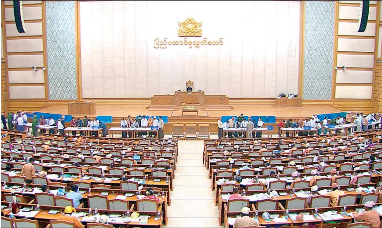
ပြည်ထောင်စုလွှတ်တော်ကိုယ်စားလှယ်များ သတ်မှတ်နေရာတွင် လျှို့ဝှက်ဆန္ဒပြုခြင်းနည်းလမ်းဖြင့် ဆန္ဒမဲပေးကြစဉ်။

ထို့နောက် ပြည်ထောင်စုလွှတ်တော် နာယက က လွှတ်တော်ကိုယ်စား