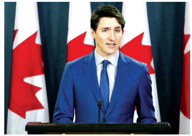
ကနေဒါဝန်ကြီးချုပ် ဂျက်စတင်ထရူးဒိုကို တွေ့ရစဉ်။

ကနေဒါနိုင်ငံထဲကို ကနေဒါနိုင်ငံသားမဟုတ်သူများနှင့် အမြဲတမ်းနေထိုင်ခွင့်မရှိသူများ လုံးဝဝင်ရောက်ခွင့်ပြုမည်မဟုတ်ကြောင်းနှင့် ဝင်ရောက်ခွင့်များကို ငြင်းဆန်သွားမည်ဖြစ်ကြောင်း ဝန်ကြီးချုပ် ဂျက်စတင်ထရူးဒိုက ပြောကြားလိုက်သည်။ လေယာဉ်ပေါ်သို့လည်း တုပ်ကွေးမိလက္ခဏာရှိသူများကို လိုက်ပီစီးနင်းခွင့် မပြုရန် အမိန့်ထုတ်ပြန်ထားကြောင်းနှင့် ကနေဒါနိုင်ငံသို့ ပျံသန်းထွက်ခွာလာသော နိုင်ငံတကာလေကြောင်းလိုင်းများကိုလည်း ကိုရိုနာဗိုင်းရပ်စ်ပိုး ရှိ မရှိ အရှိန်မြှင့်စစ်ဆေးမှုများပြုလုပ်နိုင်ရန် ပြည်တွင်းလေဆိပ်လေးခုဖြစ်သည့် မွန်ထရယ်၊ တော်ရန်းဒိုး၊ ကယ်ဂယ်ရီနှင့် ဗန်ကူးပေးလေဆိပ်များတွင်သာရပ်နားရန် တိုက်တွန်းထားကြောင်း သတင်းရရှိသည်။ ယခုလို နယ်စပ်ကိုပိတ်လိုက်ခြင်းသည် မတ် ၁၈ ရက် မွန်းလွဲပိုင်းမှစတင်ကာ အကျိုးသက်ရောက်မည်ဖြစ်ကြောင်း သယ်ယူပို့ဆောင်ရေးဝန်ကြီး မာဂျီနီယူက ပြောသည်။ အမေရိကန်နိုင်ငံနှင့် ကနေဒါနိုင်ငံတို့သည် နှစ်နိုင်ငံဆက်ဆံရေးနှင့် စီးပွားရေးပူးပေါင်းဆောင်ရွက်မှု အဆင့်မြှင့်မားလာသောကြောင့် နယ်စပ်ပိတ်ဆို့မှုတွင် အမေရိကန်နိုင်ငံသားများမပါဝင်ကြောင်း ဝန်ကြီးချုပ် ဂျက်စတင်ထရူးဒိုက ပြောသည်။ ထို့အတူ လေယာဉ်အမှုထမ်းများ၊ သံတမန်များနှင့် လတ်တလော ကနေဒါနိုင်ငံသားဖြစ်သွားသူများလည်း မပါဝင်ကြောင်း ဂျက်စတင်ထရူးဒိုက ပြောသည်။ ကနေဒါတော်ချိန် နံနက် ၉ နာရီတွင် ကနေဒါနိုင်ငံတွင် ကိုရိုနာဗိုင်းရပ်စ် အတည်ပြုလူနာ ၃၂၄ ဦးရှိကြောင်းသိရပြီး တစ်ဦးမှာ သေဆုံးခဲ့ကြောင်း သတင်းရရှိသည်။ သို့သော်လည်း ဒေသတွင်းမီဒီယာများက ဗြိတိသျှ ကိုလံဘီယာ ပြည်နယ်တွင် ကိုရိုနာဗိုင်းရပ်စ်ကြောင့် သေဆုံးသူ သုံးဦးအထိရှိခဲ့ကြောင်း သတင်းများတွင် ဖော်ပြခဲ့သည်။ အေအက်ဖီပီ