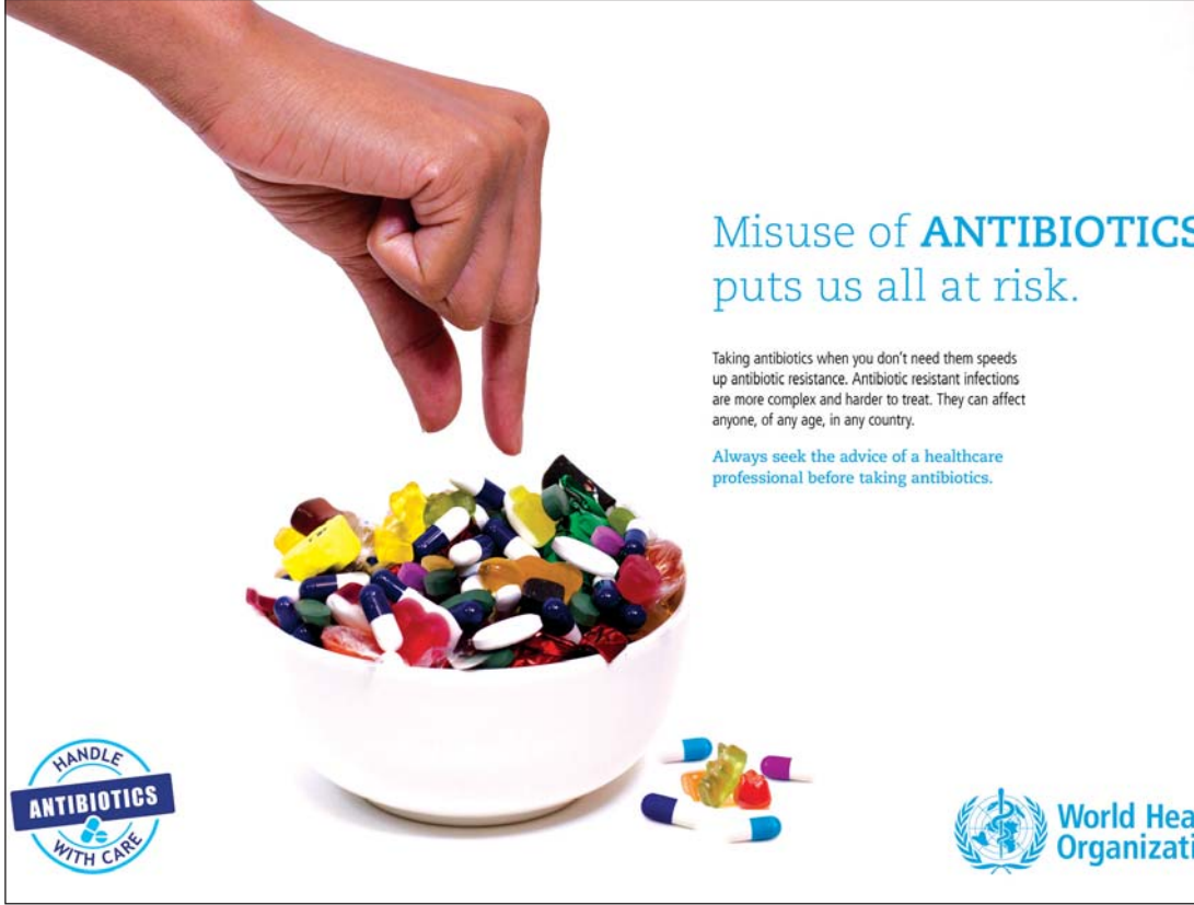
ပဋိဇီဝဆေးသုံးစွဲမှုနှင့် ပတ်သက်၍ ကမ္ဘာကျန်းမာရေးအဖွဲ့ကြီးက ထုတ်ထားသည့် ပညာပေး ပိုစတာ

ပဋိဇီဝဆေးယဉ်ပါးမှုပြဿနာသည် ယခုအခါ ဆင်းရဲချမ်းသာမရွေး၊ လူမျိုးတိုင်း၊ နိုင်ငံတိုင်းအတွက် လတ်တလော ရင်ဆိုင်နေထိုင်ရမည့် ကျန်းမာရေးပြဿနာတစ်ခုဖြစ်ပါသည်။ တစ်ကမ္ဘာလုံးဆိုင်ရာ ကျန်းမာရေး၊ အစားအသောက် ဘေးကင်းရေးနှင့် ဖွံ့ဖြိုးတိုးတက်ရေးတို့ကို ခြိမ်းခြောက်နေသော အဓိက အရာများထဲတွင် တစ်ခုအပါအဝင်ဖြစ်ပါသည်။ ဆေးဘက်ဆိုင်ရာ ပညာရှင်များ၏ သုံးသပ်ချက်များအရ ယခုအချိန်တွင် တစ်ကမ္ဘာလုံး၌ ပဋိဇီဝဆေးမတိုးသော ရောဂါပိုးကြောင့် သေဆုံးမှုနှုန်းသည် ၂၀၁၆ ခုနှစ်တွင် ခုနှစ်သိန်းခန့် ရှိခဲ့ပြီး ၂၀၅၀ ပြည့်နှစ်တွင် သိန်း ၁၀၀ အထိ မြင့်တက်လာနိုင်သည်ဟု ဆိုပါသည်။ မြန်မာနိုင်ငံကဲ့သို့ ဖွံ့ဖြိုးဆဲနိုင်ငံများတွင် ဆေးမတိုးသောရောဂါ ဖြစ်ပွားမှုနှုန်း ပို၍ မြင့်မားလာနိုင်ပါသည်။ ကာကွယ်တိုက်ဖျက်ရေးအတွက် ပို၍ ခက်ခဲနိုင်ပါသည်။ ထို့ကြောင့် အစိုးရပုဂ္ဂလိကနှင့် ပြည်သူများ အတူတကွ ပူးပေါင်းဆောင်ရွက်မှသာ ကာကွယ်တားဆီးနိုင်မည်