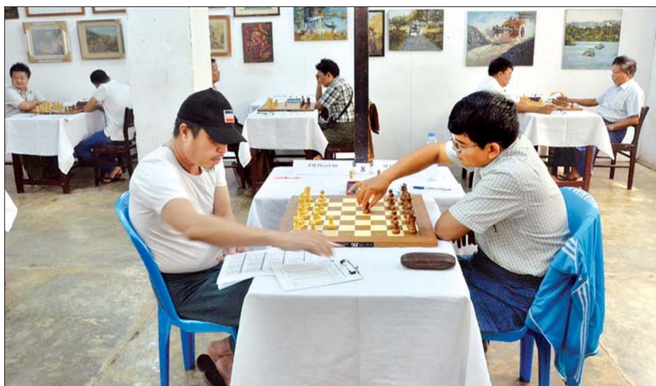
(၄၆)ကြိမ်မြောက် အမျိုးသားတံခွန်စိုက်စစ်တုရင် ချန်ပီယံပြိုင်ပွဲ ကျင်းပစဉ်။