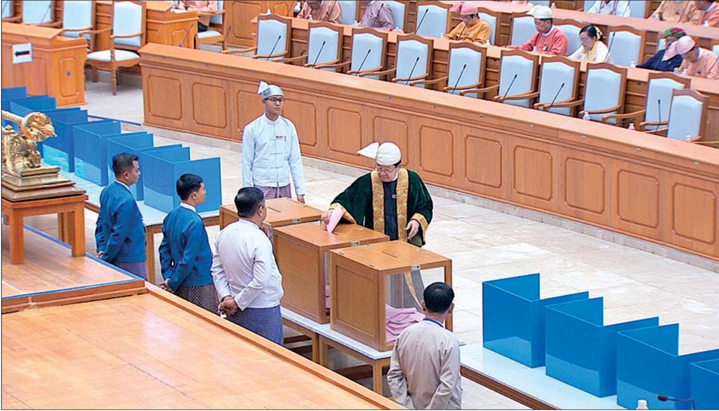
ပြည်ထောင်စုလွှတ်တော်နာယက ဦးတီခွန်မြတ် သတ်မှတ်နေရာတွင် လျှို့ဝှက်ဆန္ဒပြုခြင်းနည်းလမ်းဖြင့် ဆန္ဒမဲပေးစဉ်။