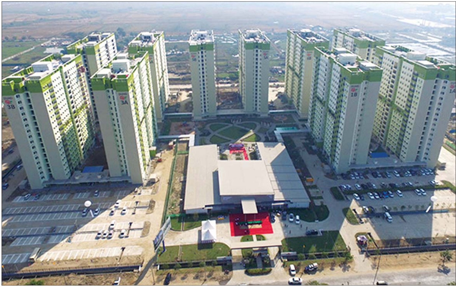
ဒဂုံမြို့သစ် ဆိပ်ကမ်း Smart District စီမံကိန်းပုံစံပုံစံ။

ဒဂုံမြို့သစ်(ဆိပ်ကမ်း) ဟာ ရန်ကုန်မြို့ရဲ့ အရှေ့အလယ်ပိုင်းမှာ တည်ရှိပြီး ၁၉၉၀ ပြည့်နှစ်မှာ အကောင်အထည်ဖော်ခဲ့ကာ ၂၀၀၀ ပြည့်နှစ်မှာတော့ အစိုးရမူလတန်းကျောင်း ၁၀ ကျောင်း၊ အလယ်တန်းကျောင်း ၁၀ ကျောင်း၊ အထက်တန်းကျောင်း တစ်ကျောင်း တည်ရှိခဲ့ပါတယ်။ စက်မှုဇုန်တစ်ခုလည်းရှိကာ