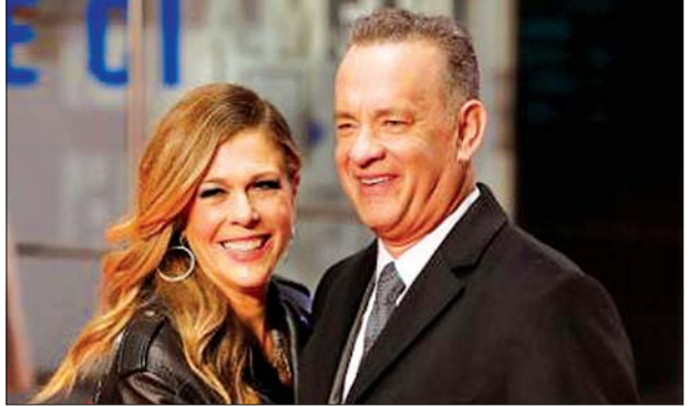
ရုပ်ရှင်မင်းသားကြီးတွမ်ဟန်နှင့် ဇနီးဖြစ်သူရီတာဝေလ်ဆင်

ရုပ်ရှင်မင်းသားကြီး တွမ်ဟန်နှင့် ဇနီးသည်ရီတာဝေလ်ဆင်တို့ဟာ ဩစတြေးလျ နိုင်ငံ ကွင်းစလန်းဆေးရုံကနေ ဆင်းသွားပြီလို့သိရပါတယ်။ အခုအခါမှာတော့ အိမ်မှာပဲ သီးခြားခွဲနေတယ်လို့ တွမ်ဟန်ရဲ့ ပြောရေးဆိုခွင့်ရှိသူက ပြောပါတယ်။ သူတို့စုံတွဲဟာ ပြီးခဲ့တဲ့သီတင်းပတ်က ကိုရိုနာဗိုင်းရပ်စ်ကူးစက်ခံထားရ ကြောင်း ဆေးစစ်တွေ့ရှိပြီးတဲ့နောက် ဆေးရုံပေါ်မှာ သီးခြားခွဲနေရတာပဲဖြစ်ပါတယ်။ တွမ်ဟန်တို့စုံတွဲဟာ ရုပ်ရှင်အကြို ရိုက်ကူးထုတ်လုပ်ရေးအတွက် ဩစတြေးလျနိုင်ငံကို ရောက်ရှိနေကြတာပဲ ဖြစ်ပါတယ်။ အခုအခါမှာတော့ ရုပ်ရှင်ရိုက်ကူးရေးကိုလည်း ရပ်နားထားရပါတယ်။ “ကိုယ်ခန္ဓာမှာ ကိုက်ခဲနေပြီး ပင်ပန်းနွမ်းနယ်မှုခံစားခဲ့ရပါတယ်။ နှစ်ဦးစလုံးမှာ အဖျားကိုယ်စီရှိတဲ့အတွက် ဆေးစစ်မှုခံယူရာမှာ ကိုရိုနာဗိုင်းရပ်စ်ကူးစက်ခံရ တာကို တွေ့ရှိခဲ့ရတယ်”လို့ တွမ်ဟန်ကပြောပါတယ်။ ပြည်သူ့ကျန်းမာရေးနဲ့လုံခြုံရေးအတွက် သူတို့နှစ်ဦးဟာ နေအိမ်မှာပဲနေပြီး အပြင်မထွက်ဘဲ စိတ်ချရတဲ့ အချိန်ထိနေမှာပါ။ တွမ်ဟန်ဟာ သူတို့နှစ်ဦးပြန်လည်သက်သာလာတဲ့ သတင်းတွေကိုလည်း မျှဝေပေးခဲ့ပါတယ်။ အေဘီစီ လိုကယ်