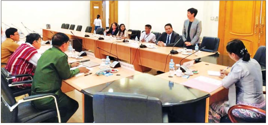
အမျိုးသားလွှတ်တော် တိုင်းရင်းသားရေးရာကော်မတီနှင့် Westminster Foundation for Democracy (WFD) မှ အကြံပေးပုဂ္ဂိုလ် Mr. Stephen Twigg တို့ တွေ့ဆုံဆွေးနွေးစဉ်။

“ တိုင်းရင်းသားတွေရဲ့ ပညာရေးကဏ္ဍနဲ့ ပတ်သက်ပြီး တော့လည်း တိုးတက်အောင်ဆောင်ရွက်ဖို့ တိုင်းရင်းသား ပညာရေးကို ထောက်ပံ့နေတဲ့အဖွဲ့အစည်း ယူနီဆက်ဖ်နဲ့ ချိတ်ဆက်ဆောင်ရွက်ဖို့ အစီအစဉ်တွေ ရှိပါတယ်။ ကျွန်တော်တို့ တိုင်းရင်းသားရေးရာ ကော်မတီအနေနဲ့ တိုင်းရင်းသားတွေရဲ့ ဘာသာ၊ စာပေ၊ စကား၊ ရိုးရာ ယဉ်ကျေးမှုတွေနဲ့ပတ်သက်ပြီး ပေါင်းစပ်ဆောင်ရွက်ပေး လျက်ရှိပါတယ်”