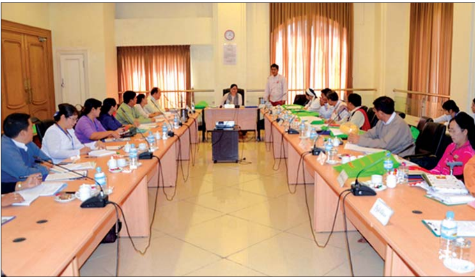
အမျိုးသားလွှတ်တော် တိုင်းရင်းသားရေးရာကော်မတီနှင့် တိုင်းရင်းသားလူမျိုးများရေးရာဝန်ကြီးဌာနမှ တာဝန်ရှိသူများ တွေ့ဆုံဆွေးနွေးစဉ်။