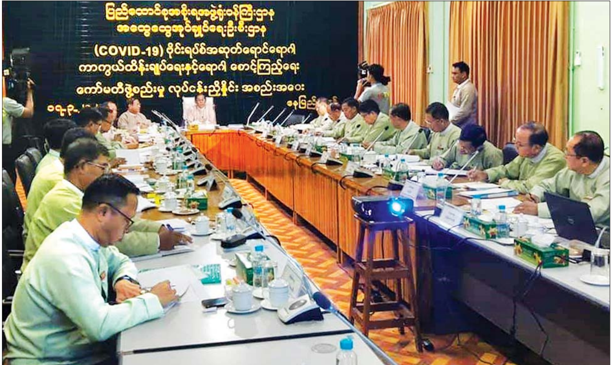
ပြည်ထောင်စုဝန်ကြီး ဦးမင်းသူ Coronavirus Disease 2019 (COVID-19) ကာကွယ်၊ ထိန်းချုပ်၊ ကုသရေးနှင့် စပ်လျဉ်း၍ တိုင်းဒေသကြီး/ပြည်နယ်များအလိုက် လုပ်ငန်းကော်မတီဖွဲ့စည်းနိုင်ရေး တိုင်းဒေသကြီး/ပြည်နယ်အုပ်ချုပ်ရေးမှူးများနှင့် လုပ်ငန်းညှိနှိုင်းအစည်းအဝေးတွင် အမှာစကားပြောကြားစဉ်။ သတင်းစဉ်