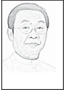
မောင်စာက

ရွေးကောက်ပွဲဟုဆိုလျှင် နိုင်ငံရေးပါတီများ၏ အခန်းကဏ္ဍက အရေးပါလာသည်။ ရွေးကောက်ပွဲကို ပြည်ထောင်စုရွေးကောက်ပွဲကော်မရှင်နှင့် ကော်မရှင်အဖွဲ့ခွဲအဆင့်ဆင့်တို့က စီမံကြီးကြပ်ဆောင်ရွက်ကြရသည်။ နိုင်ငံရေးပါတီများမှ ကိုယ်စားလှယ်လောင်းများနှင့် တစ်သီးပုဂ္ဂလ ကိုယ်စားလှယ်လောင်းများ ဝင်ရောက်ယှဉ်ပြိုင်ကြသည်။ မဲဆန္ဒရှင်ပြည်သူများက ဆန္ဒမဲပေးကြရသည်။ ဤသို့ဖြင့် ရွေးကောက်ပွဲတိုင်း ရွေးကောက်ပွဲတိုင်း ပြည်ထောင်စုရွေးကောက်ပွဲကော်မရှင်၊ နိုင်ငံရေးပါတီများနှင့် မဲဆန္ဒရှင်များ သုံးဦးသုံးဖလှယ်သည် ကြိမ်ပုံသဏ္ဍာန်အဖြစ် မြင်တွေ့ကြရသည်။ ဤတွင် ရွေးကောက်ပွဲနှင့် နိုင်ငံရေးပါတီများအကြောင်း အနှစ်ချုပ်မျှဝေပါရစေ။