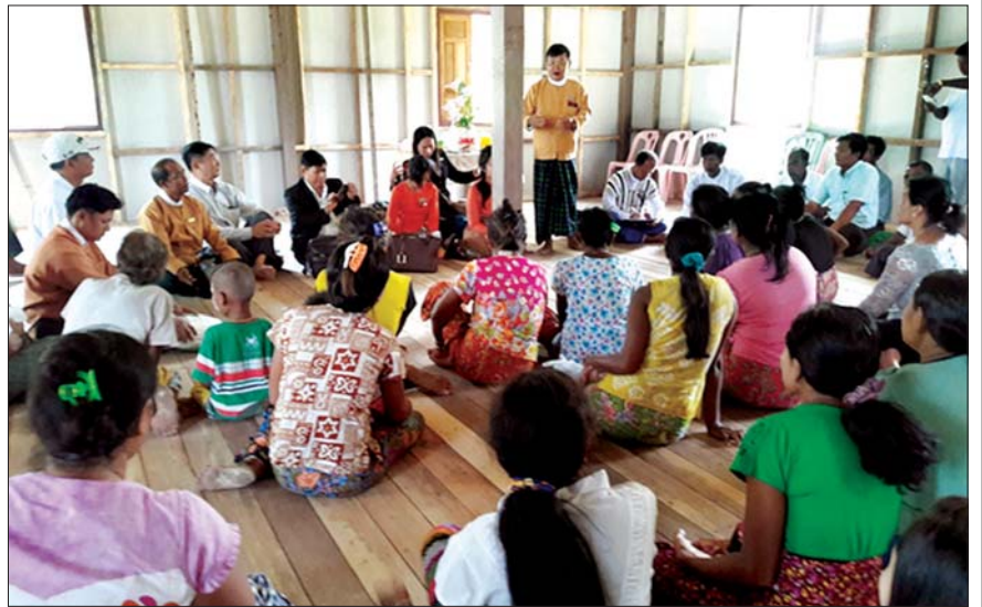
အမျိုးသားလွှတ်တော် တိုင်းရင်းသားရေးရာကော်မတီက မကြိုဂလက်ကျွန်းဘော်ဒါဆောင်တွင် ဆလုံတိုင်းရင်းသားများနှင့် တွေ့ဆုံစဉ်။