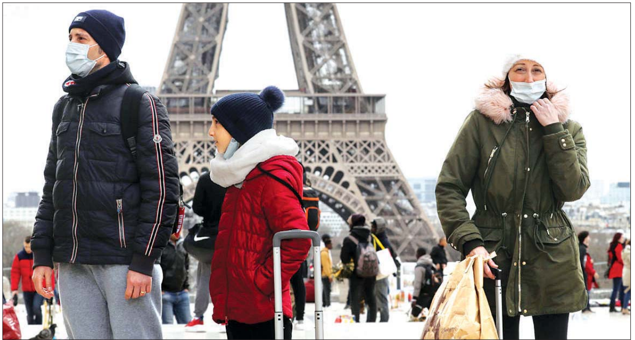
အိမ်ထဲမှာပဲနေရဖို့အမိန့်ထုတ်တဲ့ နှာခေါင်းစည်းတပ်ဆင်ကာ သွားလာနေကြသည့် ပြည်သူများ။

ဆေးပညာရှင်တွေက လတ်တလောအခြေအနေတွေနဲ့ပတ်သက်ပြီး အန္တရာယ်ကိုသတိပေးထားပါလျက်နဲ့တောင် ပန်းခြံတွေမှာ လူတွေအတူတကွ စုဝေးနေတာကို တွေ့နေရတုန်းပဲ။ လူထုထပ်တဲ့ ဈေးတွေ၊ စားသောက်