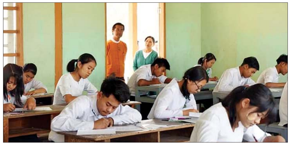
ပြည်နယ်ဝန်ကြီးချုပ် ဦးအယ်လ်ဖောင်းရှိ တက္ကသိုလ်ဝင်စာမေးပွဲ ဖြေဆိုနေသည့် ကျောင်းသား ကျောင်းသူများအား ကြည့်ရှုအားပေးစဉ်။