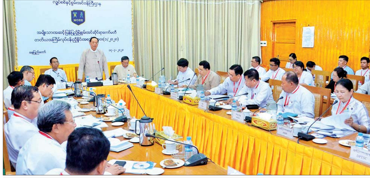
ပြည်ထောင်စုဝန်ကြီး ဦးဝင်းခိုင် အမျိုးသားအဆင့် ပြန်ပြည့်မြဲစွမ်းအင်ဆိုင်ရာကော်မတီ၏ တတိယအကြိမ် လုပ်ငန်းညှိနှိုင်းအစည်းအဝေး (၁/၂၀၂၀) တွင် အမှာစကားပြောကြားစဉ်။

သက်ဆိုင်သူများ၏ အားစိုက်ဆောင်ရွက်မှု၊ သက်ဆိုင်ရာ ဌာနအဖွဲ့အစည်း များနှင့် ပြည်သူများ၏ ပူးပေါင်းဆောင်ရွက်မှုများကြောင့် မြန်မာနိုင်ငံ၏ လျှပ်စစ် ဓာတ်အားကဏ္ဍသည် လျင်လျင်မြန်မြန် ဖွံ့ဖြိုးတိုးတက်နေပြီး တစ်နိုင်လုံး လျှပ်စစ်ဓာတ်အား အသုံးပြုနိုင်မှုသည် ၂၀၁၆ ခုနှစ်တွင် ၃၄ ရာခိုင်နှုန်းရှိခဲ့ရာမှ ၂၀၁၉ ခုနှစ် ဒီဇင်ဘာလတွင် ၅၀ ရာခိုင်နှုန်း၊ ၂၀၂၀ ပြည့်နှစ်တွင် ၅၅ ရာခိုင်နှုန်း အထိ တိုးတက်အောင် ဆောင်ရွက်နေရာ ပင်မရည်မှန်းချက်ဖြစ်သည့် ၂၀၃၀ ပြည့်နှစ်တွင် ၁၀၀ ရာခိုင်နှုန်း ရရှိရေးအတွက် နိုင်ငံတော်အစိုးရ၏ လမ်းညွှန်မှုနှင့် အညီ အမျိုးသားအဆင့် ပြန်ပြည့်မြဲစွမ်းအင်ဆိုင်ရာကော်မတီက စီစဉ်ဆောင်ရွက် လျက်ရှိကြောင်း သိရသည်။