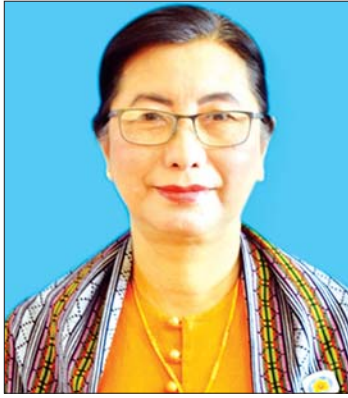
ဒေါ်နွယ်နွယ်အောင် (အမျိုးသားလွှတ်တော် တိုင်းရင်းသားရေးရာ ကော်မတီဥက္ကဋ္ဌ)

နောက်ပြီး တိုင်းဒေသကြီး၊ ပြည်နယ် လွှတ်တော်က တိုင်းရင်းသားရေးရာအဖွဲ့တွေ ကလည်း အမျိုးသားလွှတ်တော် တိုင်းရင်းသား ရေးရာကော်မတီရဲ့ လုပ်ဆောင်ချက်တွေကို လေ့လာချင်လို့ တောင်းဆိုရင် ကျွန်မတို့ တွေ့ဆုံပြီး လုပ်ငန်းဆောင်ရွက်ချက်တွေကို ရှင်းပြတာ၊ တွေ့ဆုံဆွေးနွေးတာ၊ အကြံပြုတာ တွေ ရှိပါတယ်။ ဒါ့အပြင် ပြည်တွင်း ပြည်ပ အရပ်ဘက် အဖွဲ့အစည်းတွေနဲ့လည်း အမျိုးသား လွှတ်တော်ဥက္ကဋ္ဌရဲ့ ခွင့်ပြုချက်နဲ့တွေ့ဆုံပါ တယ်။ သူတို့က အကူအညီပေးချင်တာ၊ လုပ် ဆောင်ပေးချင်တာတွေကို နားထောင်တယ်။ ကျွန်မတို့ကော်မတီကိုလေးထောင့်တဲ့ တာဝန် ဝတ္တရားထဲက ပူးပေါင်းလုပ်ဆောင်လို့ရမယ့် ကိစ္စရပ်မျိုးဆိုရင် သူတို့ရဲ့ ဆွေးနွေးအကြံပြု ချက်တွေကို ကျွန်မတို့က လွှတ်တော်ဥက္ကဋ္ဌထံ ပြန်လည်တင်ပြပြီး ခွင့်ပြုချက်ရမှ သူတို့နဲ့ ပူးပေါင်းပြီး လုပ်ငန်းဆောင်ရွက်ပါတယ်။ ငြိမ်းချမ်းရေးနဲ့ ပတ်သက်လို့ ကျွမ်းကျင်တဲ့ (၂၀) ရာစုပင်လုံညီလာခံကို ကျွန်မတို့ တိုင်းရင်း သားရေးရာကော်မတီဥက္ကဋ္ဌ အတွင်းရေးမှူးနဲ့ အဖွဲ့ဝင်ခြောက်ဦး တက်ရောက်ပါတယ်။ ဆွေး နွေးချက်တွေကို နားထောင်တယ်။ အဲဒါကို အခြေပြုပြီး ကျွန်မတို့ တိုင်းရင်းသားရေးရာ ကော်မတီက လုပ်ဆောင်နိုင်မယ့်အချက်တွေ၊ အချင်းချင်း ပြန်လည်ဆွေးနွေးတာ၊ သုံးသပ် တာတွေကို ဆောင်ရွက်ပါတယ်။ တိုင်းရင်းသားကိစ္စနဲ့ ပတ်သက်ပြီး ကော်မတီအနေနဲ့ ကော်မတီသက်တမ်း