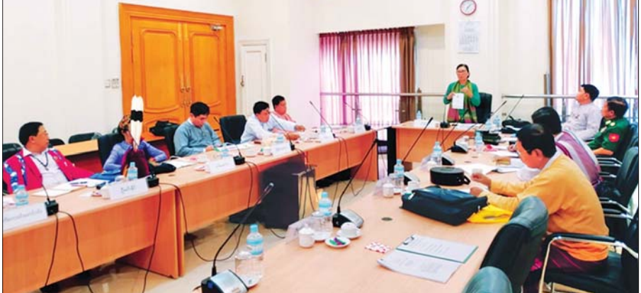
အမျိုးသားလွှတ်တော် တိုင်းရင်းသားရေးရာ ကော်မတီညှိနှိုင်း အစည်းအဝေး ကျင်းပစဉ်။

တယ်။ တိုင်းရင်းသားတွေနေထိုင်တဲ့ ဒေသ တွေကို သွားရောက်ပြီး တွေ့ဆုံတာ၊ သူတို့ရဲ့ လိုအပ်ချက်တွေ နားထောင်တာ အဲဒီလို ကွင်းဆင်းခဲ့တာ လေးကြိမ် ရှိပါတယ်။ တွေ့ဆုံပြီး တိုင်းရင်းသားတွေက တင်ပြ လာတဲ့ လိုအပ်ချက်တွေကို သက်ဆိုင်ရာ ဝန်ကြီးဌာနတွေကို အကြောင်းကြားပြီး ညှိနှိုင်းဆွေးနွေးတာ ငါးကြိမ် ရှိပါတယ်။ တိုင်းရင်းသားတွေရဲ့ဘာသာစာပေရိုး ရာ ယဉ်ကျေးမှုတွေကို ဖော်ထုတ်ပေးဖို့က ကျွန်မတို့ကော်မတီရဲ့ တာဝန်ပဲ ဖြစ်ပါတယ်။ အဓိက အဲဒါကိုပဲ ကျွန်မတို့ ဦးစားပေးပြီး ဆောင်ရွက်ပါတယ်။ တိုင်းရင်းသားတွေ နေထိုင်တဲ့ ဒေသ တွေကို သွားရောက်တာကလည်း အဲဒီ အတွက်ပဲ ဖြစ်ပါတယ်။ လွှတ်တော်မှာလည်း တိုင်းရင်းသားတွေတင်ပြလာတဲ့ အချက် အလက်တွေအပေါ် မူတည်ပြီး မေးခွန်း မေးမြန်းတာ၊ အဆိုတင်သွင်းတာတွေ လုပ် ဆောင်ပေးတာရှိသလို လွှတ်တော်နားရက် တွေမှာလည်း တိုင်းရင်းသားဒေသတွေကို သွားရောက်ပြီး သူတို့နဲ့တွေ့ဆုံတာ သူတို့ အသံတွေကို နားထောင်တာတွေ ပြုလုပ် ပါတယ်။ ရှေ့ဆက်လက်ပြီး လုပ်ဆောင် သွားမှာလည်း ဖြစ်ပါတယ်။ စာမျက်နှာ ၁၁ သို့