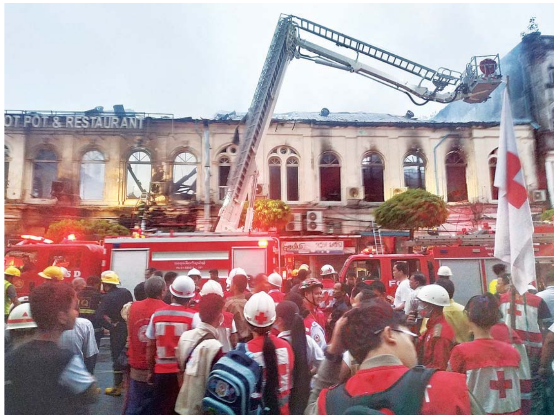
ပန်းဆိုးတန်းရှိ စားသောက်ဆိုင်တစ်ဆိုင် မီးလောင်မှုကို မီးသတ်တပ်ဖွဲ့ဝင်များ ဖြိုခွဲသတ်နေစဉ်။

သံကြားစက်များ တပ်ဆင်ထားသည်ကို တွေ့ရသည်။ ထို့အတူ ယာဉ်စီးခငွေပေးချေကတ်များအတွက် စက်များတပ်ဆင်နေသည်ကိုလည်း တွေ့နေရသည်။ ကြိုတင်ငြေငြည့်ကတ်စနစ်ဖြင့် ယာဉ်စီးခပေးချေရန် စက်များကို စမ်းသပ်နေဆဲကာလဖြစ်သည်။ ထို့ကြောင့် ယာဉ်စီးခကောက်ခံရန် စက်များစမ်းသပ်ဆဲကာလတွင် ပြည်သူများဗဟုသုတရရှိစေရန်အတွက် ကတ်တွင် ကြိုတင်ငြေငြည့်ခြင်း၊ ငွေပေးချေရာတွင် စက်အားအသုံးပြုခြင်း နည်းလမ်းများကို YBS ယာဉ်ကြီးများပေါ်တွင် အချိန်ယူ၍ အသိပညာပေးသင့်သည်။ သို့သော် ရန်ကုန်မြို့တွင် နေထိုင်သွားလာနေသူ ဖြစ်စေ၊ အခြား တိုင်းဒေသကြီး၊ ပြည်နယ်များမှ လာရောက်သူများဖြစ်စေ ငွေပေးချေကတ်စနစ်ကို အသုံးပြုရာတွင် လွယ်ကူစေမည်ဖြစ်သည်။