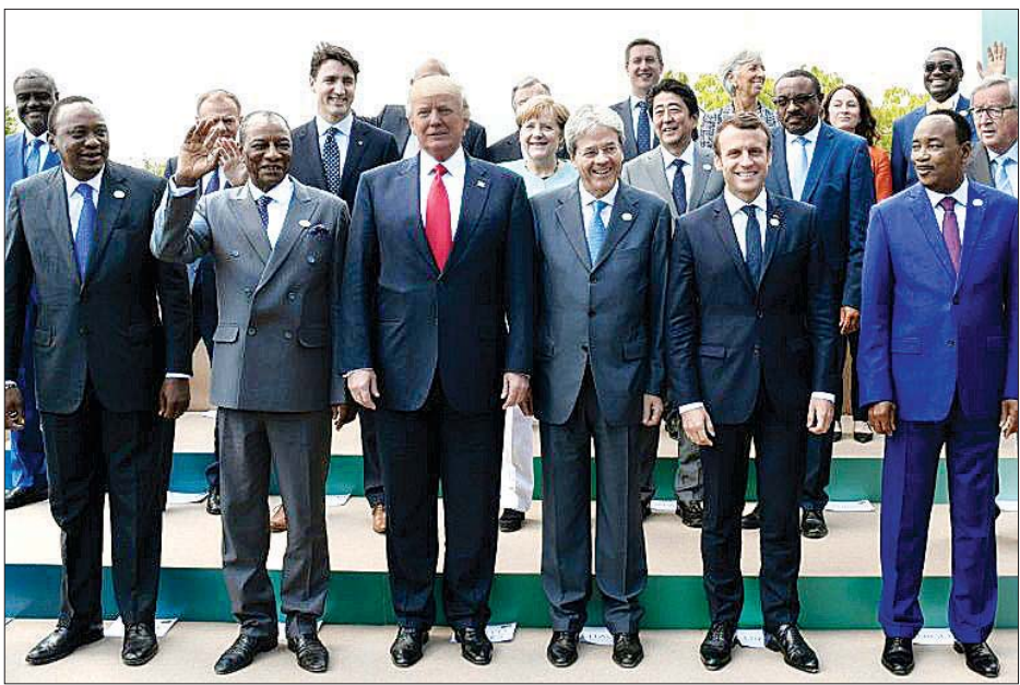
ဂျီ-၇ အဖွဲ့ဝင်နိုင်ငံခေါင်းဆောင်များကို တွေ့ရစဉ်။

ဖြစ်နိုင်သမျှ ဆောလျင်စွာ ထောက်ပံ့မှုများ လုပ်ဆောင်သွားမည်ဖြစ်ကြောင်း အဆိုပါကြေညာချက်တွင် ဆက်လက်ဖော်ပြထားသည်။ ထို့အတူ ကိုရိုနာဗိုင်းရပ်စ် ကူးစက်ပျံ့နှံ့မှုကို နှေးကွေးစေရန် နယ်စပ်ဒေသ စီမံခန့်ခွဲရေးများကို လည်း အတူတကွ လက်တွဲလုပ်ဆောင်သွားမည်ဖြစ်ကြောင်း ၎င်းကြေညာချက်တွင် ဆက်လက်ဖော်ပြထားသည်။ သီးသန့် ခွဲခြားပိတ်ဆို့မှုများ၊ ခရီးသွားလာခွင့် ကန့်သတ်မှုများကြောင့် ရှယ်ယာဈေးကွက်နှင့် စတော့ဈေးကွက်များမှာလည်း အကျဘက်သို့ ကျဆင်းလျက်ရှိသလို ကမ္ဘာ့နိုင်ငံအသီးသီးမှ အစိုးရများအနေဖြင့်လည်း ကိုရိုနာဗိုင်းရပ်စ် ပြဿနာကို မည်သို့မည်ပုံ ထိန်းချုပ်ရမည်ဆိုကာ အကျပ်ရိုက်လျက်ရှိသည်။ အေအက်ဖီပီ