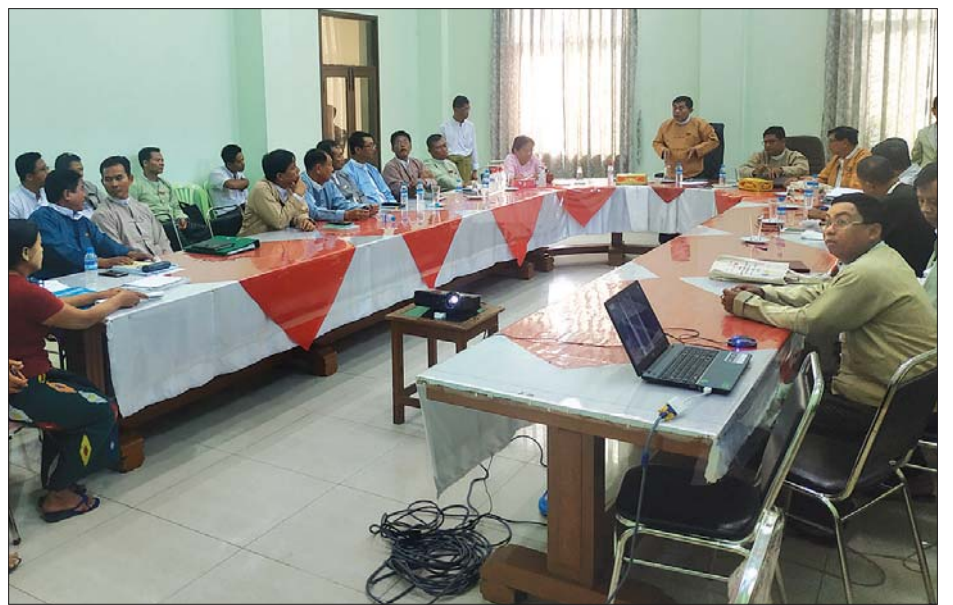
တိုင်းဒေသကြီး ဝန်ကြီးချုပ် ဦးဝင်းသိန်း ပဲခူးတက္ကသိုလ်ဧရိယာအတွင်း ပါဝင်သွားသည့် သိမ်းဆည်းခံ လယ်မြေများနှင့် ပတ်သက်၍ လယ်သမားများနှင့် တွေ့ဆုံဆွေးနွေးစဉ်။

များနှင့် လယ်ယာမြေများ ပါဝင်ခဲ့မှုအား စိစစ်ဆောင်ရွက်ပေးရန်တို့ကို တင်ပြခဲ့ရာ တိုင်းဒေသကြီး ဝန်ကြီးချုပ်က ပညာရေးဝန်ကြီးဌာနနှင့် ထပ်မံညှိနှိုင်း ဆောင်ရွက်ပေးရမည့်အချက်များနှင့် ဗဟိုမြေစစ်ကော်မတီသို့ ထပ်မံတင်ပြပေးရမည့် အခြေအနေများအား ရှင်းလင်းပြောကြားခဲ့သည်။ ပဲခူးမြို့နယ် ဥဿာမြို့သစ် ရပ်ကွက်ကြီး(၈)၊ ကွင်းအမှတ် (၆၂၆)၊ ဘုရားသုံးဆူကွင်းနှင့် အထက်စီတီးအနောက်ကျေးရွာအုပ်စု၊ ကွင်းအမှတ် (၆၁၇)၊ ဘုရားသုံးဆူကွင်း၊ မြေဧရိယာ ၇၁၈ ဒဿမ ၆၅ ဧကအား ပဲခူးတက္ကသိုလ်မြေအဖြစ် ၁၉၉၇ ခုနှစ် မေ ၁၆ ရက်က သိမ်းဆည်းခဲ့ပြီး၊ ယခုအခါ အဆိုပါမြေဧရိယာအနက်မှ မြေဧရိယာက ၁၆၀ အား အစိုးရစက်မှု၊ လက်မှုသိပ္ပံ (ပဲခူး) မြေအဖြစ် အသုံးပြုခြင်းဖြစ်ကြောင်း သိရသည်။ ဟိန်းထက်(ပဲခူး)