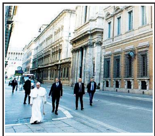
ခြေကျင်ထွက်လာသည့် ပုပ်ရဟန်းမင်းကြီးကို မတ် ၁၅ ရက်က တွေ့ရစဉ်။