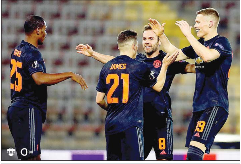
ဂိုးသွင်းအပြီး မန်ယူအသင်းသားများ အောင်ပွဲခံနေစဉ်။