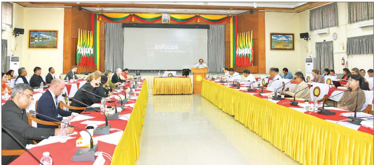
ပြည်ထောင်စုဝန်ကြီး ဒေါက်တာမြင့်ထွေး COVID-19 ရောဂါ ကာကွယ်ထိန်းချုပ်ရေးလုပ်ငန်းများတွင် မိတ်ဖက်အဖွဲ့အစည်းများ ပိုမိုပါဝင်၍ ထိရောက်စွာဆောင်ရွက်နိုင်ရေး ညှိနှိုင်းအစည်းအဝေးတွင် အမှာစကား ပြောကြားစဉ်။

ရောဂါကာကွယ် ထိန်းချုပ်၊ ကုသရေးဗဟိုကော်မတီအစည်းအဝေး၊ ကျန်းမာရေးနှင့် အားကစားဝန်ကြီးဌာန ဗဟိုအဆင့်ညှိနှိုင်းအစည်းအဝေးနှင့် ဝန်ကြီးဌာနများ ပေါင်းစပ်ညှိနှိုင်းမှုအစည်းအဝေးများပြုလုပ်၍ လည်းကောင်း၊ တိုင်းဒေသကြီး/ပြည်နယ်အဆင့် ညှိနှိုင်းအစည်းအဝေးများပြုလုပ်၍ လည်းကောင်း၊ ဗဟိုအဆင့်နှင့် တိုင်းဒေသကြီး/ပြည်နယ်အဆင့် ကျန်းမာရေးဌာနများ video conferencing များဖြင့် ချိတ်ဆက်၍လည်းကောင်း ရောဂါ