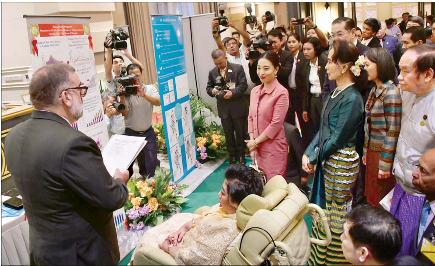
နိုင်ငံတော်၏အတိုင်ပင်ခံပုဂ္ဂိုလ် ဒေါ်အောင်ဆန်းစုကြည်နှင့် ထိုင်းတော်ဝင်မင်းသမီးများ ပြည်သူ့လူထုအခြေပြုအဖွဲ့အစည်းများ၏ HIV ကာကွယ်ရေးဆောင်ရွက်ချက် မှတ်တမ်း ပိုစတာပြခန်းအား လှည့်လည်ကြည့်ရှုကြစဉ်။ သတင်းစဉ်