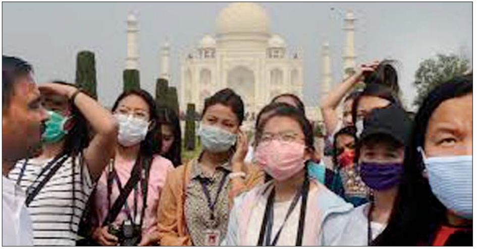
အိန္ဒိယနိုင်ငံသို့ လာရောက်လည်ပတ်နေသော နိုင်ငံခြားသားဧည့်သည်များကို တွေ့ရစဉ်။

သတင်းရရှိသည်။ အဆိုပါ တင်းကျပ်စွာကန့်သတ်ချက်တွင် ဖေဖော်ဝါရီ ၁၅ ရက်အထိ တရုတ်နိုင်ငံ၊ အီတလီနှင့် အခြားနိုင်ငံ ငါးနိုင်ငံသို့ သွားရောက်ခဲ့သူများကို ရောဂါခြေချုပ်ဖြင့် ၁၄ ရက်ကြာစောင့်ကြည့်မည်ဖြစ်ကြောင်း ဖော်ပြထားသည်။ အိန္ဒိယနိုင်ငံသည် သူ့နိုင်ငံသားများကို မလိုအပ်ဘဲ နိုင်ငံခြားခရီးသွားလာခြင်း မပြုလုပ်ရန် တင်းကျပ်စွာ အကြံပြုထားသည်။ နိုင်ငံရပ်ခြားသို့ သွားရောက်သူများသည်လည်း အမိမြေသို့ပြန်လည်ရောက်ရှိလာပါက ၎င်းတို့ကို ၁၄ ရက်ကြာ သီးသန့်ခွဲထားပြီး ရောဂါအခြေအနေကို စောင့်ကြည့်စစ်ဆေးသွားမည်ဖြစ်ကြောင်း သိရသည်။ အိန္ဒိယနိုင်ငံသည် ကိုရိုနာဗိုင်းရပ်စ်ကူးစက်ပျံ့နှံ့မှုကို ကြိုတင်ကာကွယ်သည့်အနေဖြင့် မြန်မာနိုင်ငံနှင့် ထိစပ်