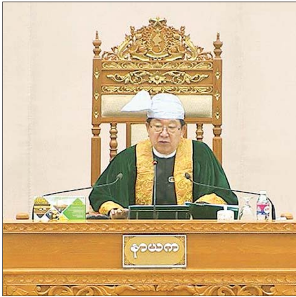
ပြည်ထောင်စုလွှတ်တော်နာယက ဦးတီခွန်မြတ်

ထို့နောက် ပြည်ထောင်စုလွှတ်တော်နာယက က လွှတ်တော်ကိုယ်စား