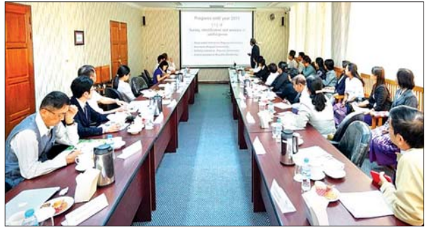
မြန်မာနိုင်ငံ၏ ဆန်စပါးမျိုး မွေးမြူရေးချယ်ရေးကဏ္ဍမြှင့်တင်ခြင်းဆိုင်ရာ အစည်းအဝေးကျင်းပပုံ။