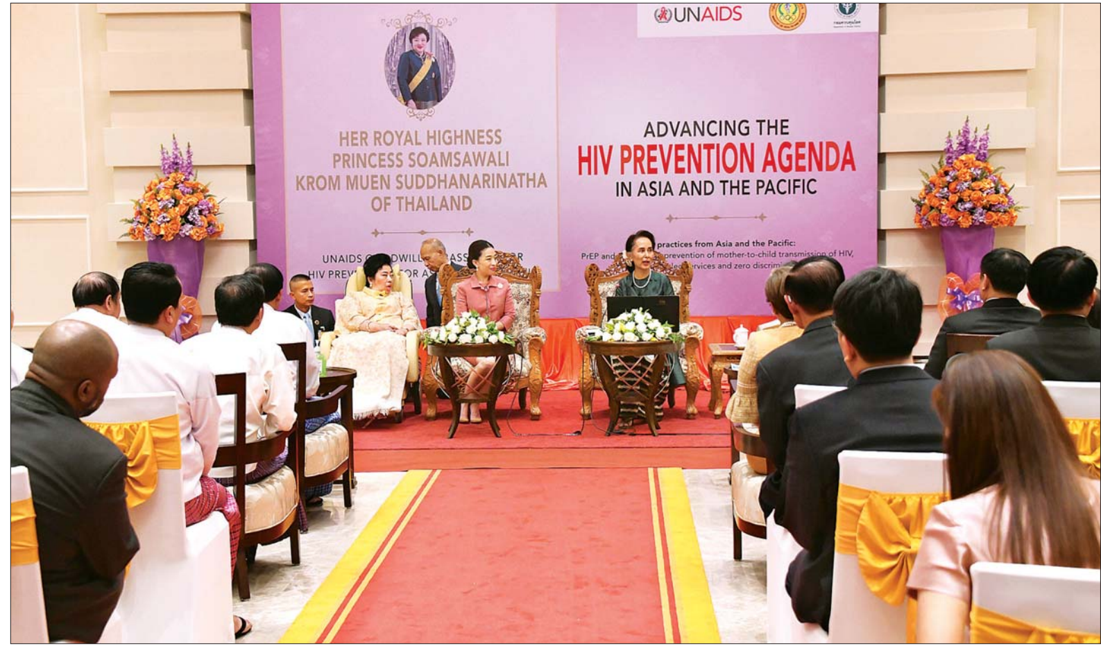
နိုင်ငံတော်၏အတိုင်ပင်ခံပုဂ္ဂိုလ် ဒေါ်အောင်ဆန်းစုကြည် မြန်မာ-ထိုင်း နှစ်နိုင်ငံအကြား HIV ရောဂါ ကာကွယ်တိုက်ဖျက်ရေးလုပ်ငန်းစဉ်များ တိုးမြှင့်ရေးဆိုင်ရာ အခမ်းအနားတွင် အမှာစကား ပြောကြားစဉ်။ သတင်းစဉ်

နေပြည်တော် မတ် ၁၃ မြန်မာ-ထိုင်း နှစ်နိုင်ငံအကြား HIV ရောဂါကာကွယ်တိုက်ဖျက်ရေး လုပ်ငန်းစဉ်များ တိုးမြှင့်ရေးဆိုင်ရာ အခမ်းအနားကို ယနေ့ညနေ ၅ နာရီ မိနစ် ၄၀ တွင် နေပြည်တော်ရှိ Hilton Hotel ၌ ကျင်းပရာ နိုင်ငံတော်၏ အတိုင်ပင်ခံပုဂ္ဂိုလ် ဒေါ်အောင်ဆန်း စုကြည် တက်ရောက်အမှာစကား ပြောကြားသည်။ အခမ်းအနားသို့ အပြည်ပြည် ဆိုင်ရာ ပူးပေါင်းဆောင်ရွက်ရေး ဝန်ကြီးဌာန ပြည်ထောင်စုဝန်ကြီး ဦးကျော်တင်၊ ကျန်းမာရေးနှင့် အားကစားဝန်ကြီးဌာန ပြည်ထောင်စု ဝန်ကြီး ဒေါက်တာ မြင့်ထွေး၊ ဒုတိယဝန်ကြီး ဒေါက်တာမြလေးစိန်၊ အမြဲတမ်းအတွင်းဝန်များ၊ ညွှန်ကြား ရေးမှူးချုပ်များနှင့် တာဝန်ရှိသူ များ၊ ထိုင်းတော်ဝင်မင်းသမီးများ ဖြစ်ကြသည့် Princess Soamsawali Krom Muen Suddhanarinatha နှင့် Princess Bajrakitiyabha ၊ ကိုယ်စားလှယ်အဖွဲ့ဝင်များ၊ မြန်မာ နိုင်ငံဆိုင်ရာ ထိုင်းနိုင်ငံ သံအမတ်ကြီး မစ္စစ် ဆူဖတ်သရာ ဆီမိုင်း သရီဖိတပ် နှင့် သံရုံးတာဝန်ရှိသူများ တက်ရောက် ကြသည်။ စာမျက်နှာ ၃ ကော်လံ ၁၀