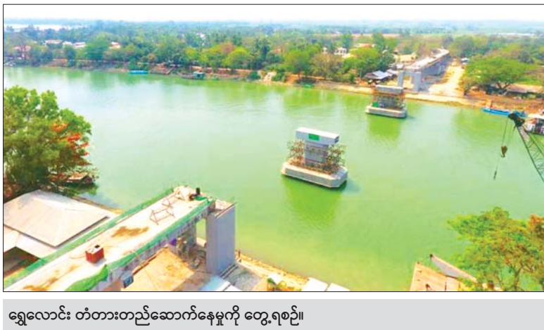
ရွှေလောင်း တံတားတည်ဆောက်နေမှုကို တွေ့ရစဉ်။

ရန်ကုန် မတ် ၁၃ ရွှေလောင်းကြိုးတံတားအား သံကူကွန်ကရစ်တံတားအဖြစ် အစားထိုးအဆင့်မြှင့်တင်တည်ဆောက်ရေးလုပ်ငန်းကို ဆောက်လုပ်ရေးဝန်ကြီးဌာန တံတားအထူးအဖွဲ့ (၁၅)က တာဝန်ယူ၍ ဆောင်ရွက်လျက်ရှိရာ ယခုအခါ တံတား တစ်စင်းလုံး တည်ဆောက်မှုလုပ်ငန်း ၅၅ ရာခိုင်နှုန်း ပြီးစီး ပြီးဖြစ်သည်ဟု သိရသည်။