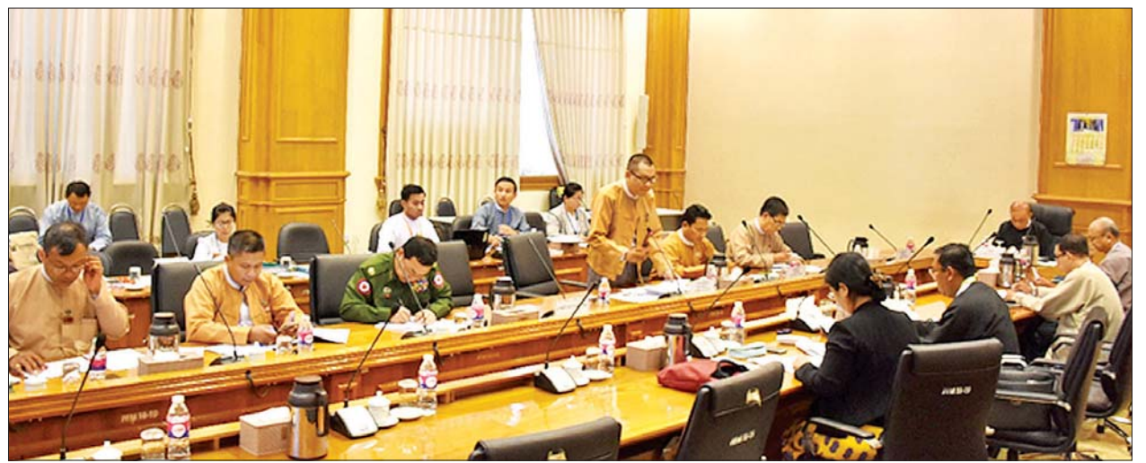
ပြည်ထောင်စုလွှတ်တော် ဥပဒေကြမ်းပူးပေါင်းကော်မတီ အစည်းအဝေးကျင်းပစဉ်။

အဆိုပါအစည်းအဝေးများသို့ ပြည်ထောင်စုလွှတ်တော် ဒုတိယနာယက၊ ဥပဒေကြမ်းပူးပေါင်းကော်မတီဥက္ကဋ္ဌ ဦးထွန်းအောင်(ခ)ဦးထွန်းထွန်းဟိန်၊ ဥပဒေကြမ်းပူးပေါင်းကော်မတီ ဒုတိယဥက္ကဋ္ဌ၊ အတွင်းရေးမှူး၊ တွဲဖက် အတွင်းရေးမှူးနှင့် ကော်မတီဝင်များ၊ ပညာရေးဝန်ကြီးဌာန၊ ကျန်းမာရေးနှင့် အားကစားဝန်ကြီးဌာန၊ ပြည်ထောင်စုရွေ့နေချုပ်ရုံးနှင့် ပြည်ထောင်စုလွှတ်တော် ရုံးတို့မှ တာဝန်ရှိသူများ တက်ရောက်ကြသည်။