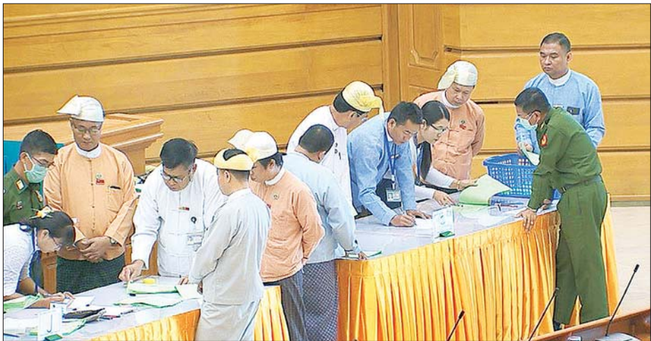
ဆန္ဒမဲလက်မှတ်များ ရေတွက်မှုနှင့် လွှတ်တော်ကိုယ်စားလှယ်များ ကြီးကြပ်စောင့်ကြည့်မှုကို တွေ့ရစဉ်။