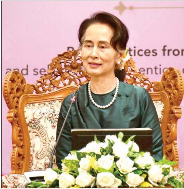
နိုင်ငံတော်၏အတိုင်ပင်ခံပုဂ္ဂိုလ် ဒေါ်အောင်ဆန်းစုကြည် မြန်မာ-ထိုင်း နှစ်နိုင်ငံအကြား HIV ရောဂါ ကာကွယ်တိုက်ဖျက်ရေးလုပ်ငန်းစဉ်များ တိုးမြှင့်ရေးဆိုင်ရာ အခမ်းအနားတွင် အမှာစကားပြောကြားစဉ်။ သတင်းစဉ်

ART ဆေးကုသမှုလုပ်ငန်းဖြင့် ရောဂါကူးစက်မှုကို ထိန်းချုပ်နိုင်သည့်အပြင် သက်တမ်းစေ့ အသက်ရှင်နေထိုင် နိုင်အောင် ဆောင်ရွက်ပေးနိုင်ခဲ့ပါကြောင်း၊ သို့သော် ယခုထက် ပိုကောင်းအောင် ဆောင်ရွက်ရန် လိုအပ်နေသေး