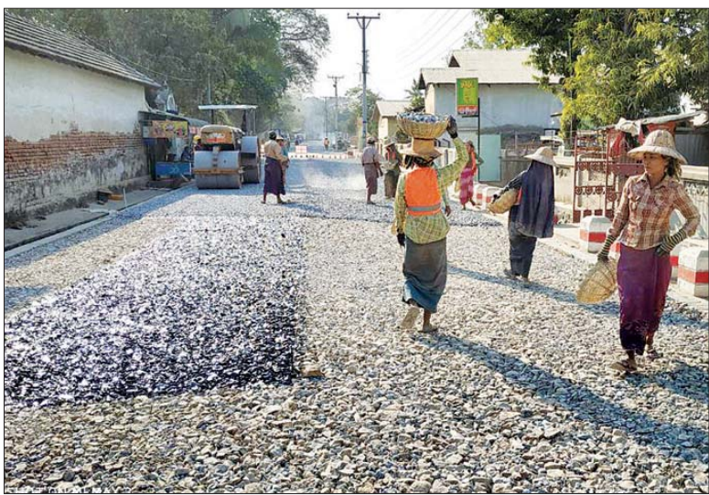
သရက်မြို့တွင်းတစ်နေရာအား လမ်းအဆင့်မြှင့်တင်နေသည့် လုပ်ငန်းခွင်။

သရက် မတ် ၁၃ မကွေးတိုင်းဒေသကြီး သရက်မြို့နယ်အတွင်းမှာ ၂၀၁၅ ခုနှစ်မှ ၂၀၁၉ ခုနှစ် လေးနှစ်တာကာလအတွင်း လမ်းတံတားများ တိုးတက်ကောင်းမွန်လာကြောင်း သိရသည်။