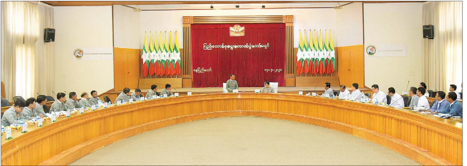
၂၀၂၀ ပြည့်နှစ် အထွေထွေရွေးကောက်ပွဲအတွက် ပြန်ကြားရေးဝန်ကြီးဌာနက ဆောင်ရွက်မည့်လုပ်ငန်းစဉ်များနှင့်စပ်လျဉ်း၍ ရှင်းလင်းဆွေးနွေးပွဲ ကျင်းပစဉ်။

ထိုသို့တွေ့ဆုံစဉ် ပြည်ထောင်စုရွေးကောက်ပွဲကော်မရှင်ဥက္ကဋ္ဌ ဦးလှသိန်းက ၂၀၂၀ ပြည့်နှစ် အထွေထွေရွေးကောက်ပွဲကို ချမှတ်ထားသည့် စံ(၅)ချက်နှင့်အညီ ကျင်းပနိုင်ရေး ပြင်ဆင်ဆောင်ရွက်လျက်ရှိကြောင်း၊ ရွေးကောက်ပွဲစနစ်တွင်ပါဝင်သော ကာလသုံးပါးဖြစ်သည့် ရွေးကောက်ပွဲအကြိုကာလ၊ ရွေးကောက်ပွဲကာလနှင့် ရွေးကောက်ပွဲနှောင်းပိုင်းကာလ တို့တွင် ပြန်ကြားရေးဝန်ကြီးဌာနနှင့် ပူးပေါင်းဆောင်ရွက်ရသည့်