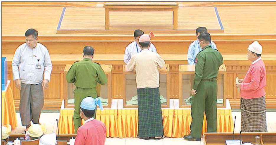
ပြည်ထောင်စုလွှတ်တော်ကိုယ်စားလှယ်များ လျှို့ဝှက်ဆန္ဒပြုခြင်းနည်းလမ်းဖြင့် ဆန္ဒမဲပေးကြစဉ်။

ဒုတိယအကြိမ် ပြည်ထောင်စုလွှတ်တော် (၁၅)ကြိမ်မြောက် ပုံမှန်အစည်းအဝေး ၂၃ ရက်မြောက်နေ့ကို မတ် ၁၆ ရက်တွင် ဆက်လက်ကျင်းပသွားမည် ဖြစ်ကြောင်း သိရသည်။ အောင်ရဲသွင်၊ အေးအေးသန်း၊ ဓာတ်ပုံ- ထန်းဖုန်