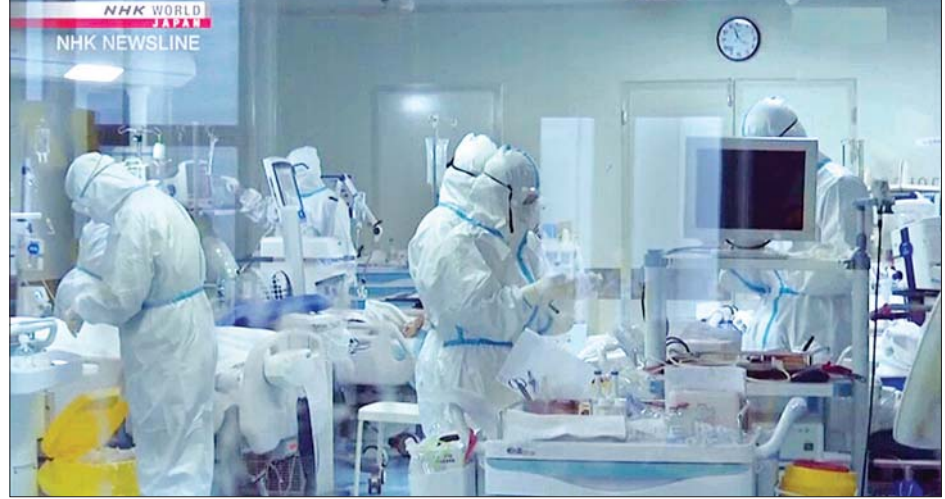
ဆေးဘက်ဆိုင်ရာတာဝန်ရှိသူများ ကိုရိုနာဗိုင်းရပ်စ်ကို ကုသနိုင်ရန် ဆောင်ရွက်နေစဉ်။