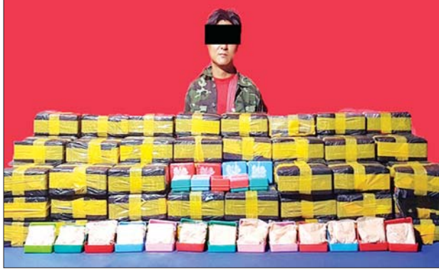
လောက်ကိုင်မြို့နယ် ရန်ကိုင်ကျေးရွာအနီး လောက်ကိုင် - ချင်းရွှေဟော် ကားလမ်းတွင် ချိန်စွမ်းချို မောင်းနှင်လာသည့် ဆိုင်ကယ်အား ရပ်တန့်ရှာဖွေရာ စိတ်ကြွေးသွပ်ဆေးပြား ၂၀၀၀ ကို သိမ်းဆည်းရမိခဲ့သဖြင့် ၎င်းတို့အား မူးယစ်ဆေးဝါးနှင့် စိတ်ကြွေးသွပ်ဆေးပြားလဲစေသော ဆေးဝါးများဆိုင်ရာ ဥပဒေအရ အရေးယူထားကြောင်း သိရသည်။

ထို့အပြင် မတ် ၁၂ ရက် မွန်းလွဲ ၁ နာရီတွင် တပ်မတော်မှ ရှမ်းပြည်နယ်