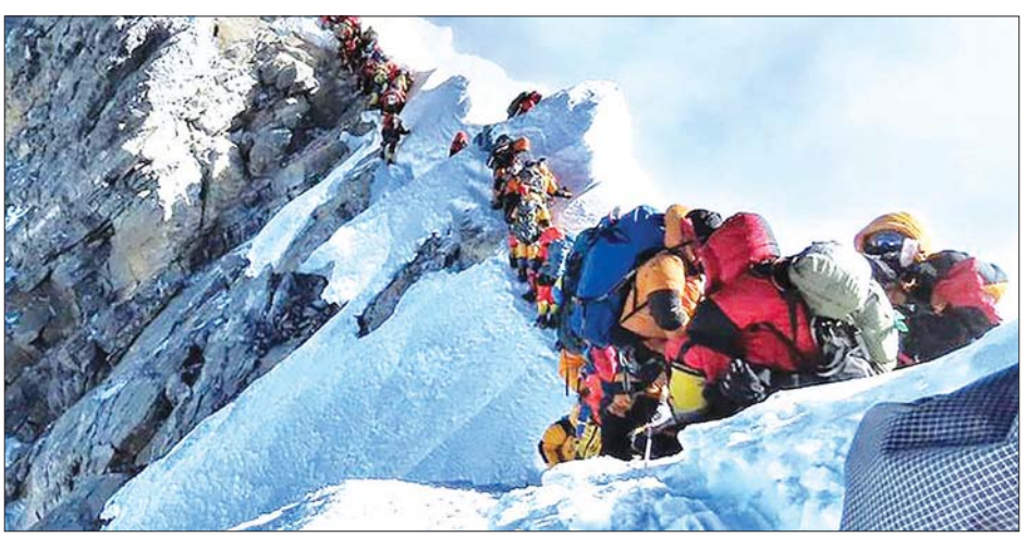
တောင်တက်ရာသီတစ်ခုတွင် ဧဝရက်တောင်ထိပ်တစ်နေရာရှိ တောင်တက်သမားများကို တွေ့ရစဉ်။