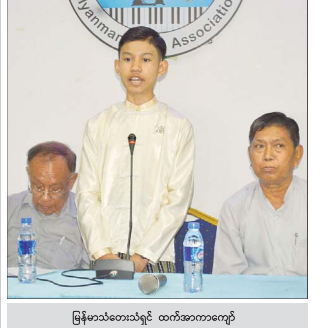
မြန်မာသံတေးသံရှင် ထက်အာကာကျော်