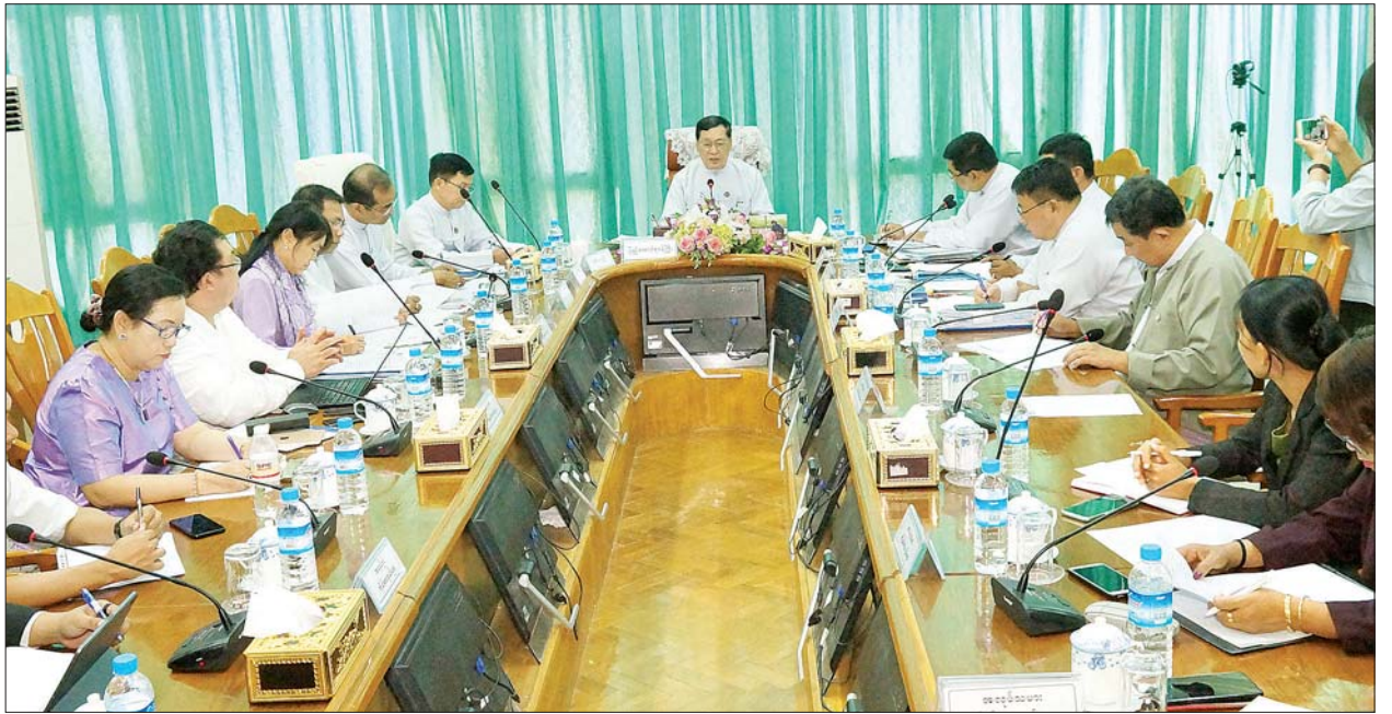
ကိုရိုနာဗိုင်းရပ်စ်ရောဂါ (COVID-19) ရိုက်ခတ်မှုဆိုင်ရာ သုံးပွင့်ဆိုင်အစည်းအဝေး ကျင်းပစဉ်။ သတင်းစဉ်

အစည်းအဝေးတွင် အလုပ်သမား၊ ကြောင်း၊ အဆိုပါကာလအတွင်း လူဝင်မှုကြီးကြပ်ရေးနှင့် ပြည်သူ့ အထည်ချုပ်စက်ရုံ ၁၈ ရုံ၊ အိတ်ချုပ် အင်အားဝန်ကြီးဌာန ပြည်ထောင်စု စက်ရုံ ၁၁ ရုံ၊ ဖိနပ်စက်ရုံ လေးရုံနှင့် ဝန်ကြီး ဦးသိန်းဆွေက ကိုရိုနာ ဗိုင်းရပ်စ်ရောဂါ (COVID-19) နှင့် အသစ်ထပ်မံ ဖွင့်လှစ်နိုင်ခဲ့သဖြင့် ပတ်သက်၍ ဝန်ကြီးဌာနအနေဖြင့် အလုပ်သမား ၁၁၅၁၁ ဦးကို အလုပ် အကိုင် အခွင့်အလမ်းအသစ်များ စက်ရုံ၊ အလုပ်ရုံများရှိ အလုပ်သမား ဖန်တီးပေးနိုင်ခဲ့ပါကြောင်း၊ နှင့် အလုပ်ရှင်များအပေါ် သက်ရောက် နိုင်မှုများကို မျက်ခြည်မပြတ် စောင့် ကြည့်၍ အခြားနိုင်ငံများတွင် ဖြစ်ပေါ် နေသောအခြေအနေများကို လေ့လာ ပြီး အလုပ်ရှင်၊ အလုပ်သမားများ အတွက် ဥပဒေနှင့်အညီ ဆောင်ရွက် ပေးနိုင်ရေး ကြိုတင်ပြင်ဆင်စီမံမှုများ ပြုလုပ်နေပါကြောင်း၊ လက်ရှိအခြေ အနေတွင် COVID-19 နှင့်ဆက်စပ်၍ လည်းကောင်း၊ ကုန်ကြမ်းပြတ်တောက် မှုနှင့် အခြားအကြောင်းတစ်ခုကြောင့် လည်းကောင်း ဇန်နဝါရီလမှ မတ် ၁၀ ရက်အထိ အပြီးပိတ်ရုံရုံရှိ ယာယီပိတ် ခြောက်ရုံနှင့် လုပ်သားအင်အား လျှော့ချမှုနှုန်းရှိခဲ့ပြီး လုပ်သားအင်အား ၃၄၁၃ ဦးကို ငွေကြေးအကျိုးခံစား ခွင့်များ ဆောင်ရွက်ပေးနိုင်ခဲ့ပါ