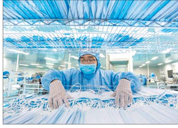
နာခေါင်းစည်းစက်ရုံမှ အလုပ်သမားတစ်ဦးကို တွေ့ရစဉ်။

ဘရင်ဆဲလ် မတ် ၁၂ အီတလီနှင့် စပိန်နိုင်ငံများသို့ ပို့ဆောင်မည့် တရုတ်နိုင်ငံမှ ပေးပို့လိုက်သည့် ဆေးဝါးအထောက်အပံ့ပစ္စည်းများ ဥရောပသို့ ရောက်ရှိခဲ့ပြီဖြစ်ကြောင်း တရုတ်နိုင်ငံခြားရေးဝန်ကြီးဌာန ပြောရေးဆိုခွင့်ရှိသူ ဟွာချွမ်ရင်၏ ပြောပြချက်အရ သိရသည်။ ဆေးဝါးဆိုင်ရာ အထောက်အပံ့ပစ္စည်းတစ်ခုခုမှာလည်း ဘယ်လ်ဂျီယံနိုင်ငံသို့ ရောက်ရှိခဲ့ပြီဖြစ်ကြောင်း သိရသည်။ အဆိုပါပစ္စည်းများတွင် နာခေါင်းစည်းပေါင်း ၁ ဒသမ ၈ သန်းနှင့် စမ်းသပ်ကိရိယာပေါင်း တစ်သန်းပါဝင်သည်ဟု ဆိုသည်။ အဆိုပါ ဆေးဝါးအထောက်အပံ့ပစ္စည်းများကို အီတလီ၊ စပိန်နိုင်ငံတို့အပါအဝင် ကိုရိုနာဗိုင်းရပ်စ်တိုက်ဖျက်ရေးတွင် ရှေ့တန်းမှ ပါဝင်ဆောင်ရွက်နေကြသည့် နေရာဒေသများသို့ ပို့ဆောင်ပေးသွားမည်ဖြစ်ကြောင်း တရုတ်နိုင်ငံခြားရေးဝန်ကြီးဌာနရုံး၏ တစ်ဘက်ကောင့်တွင် ဖော်ပြထားသည်။ ဆင်ပွာ