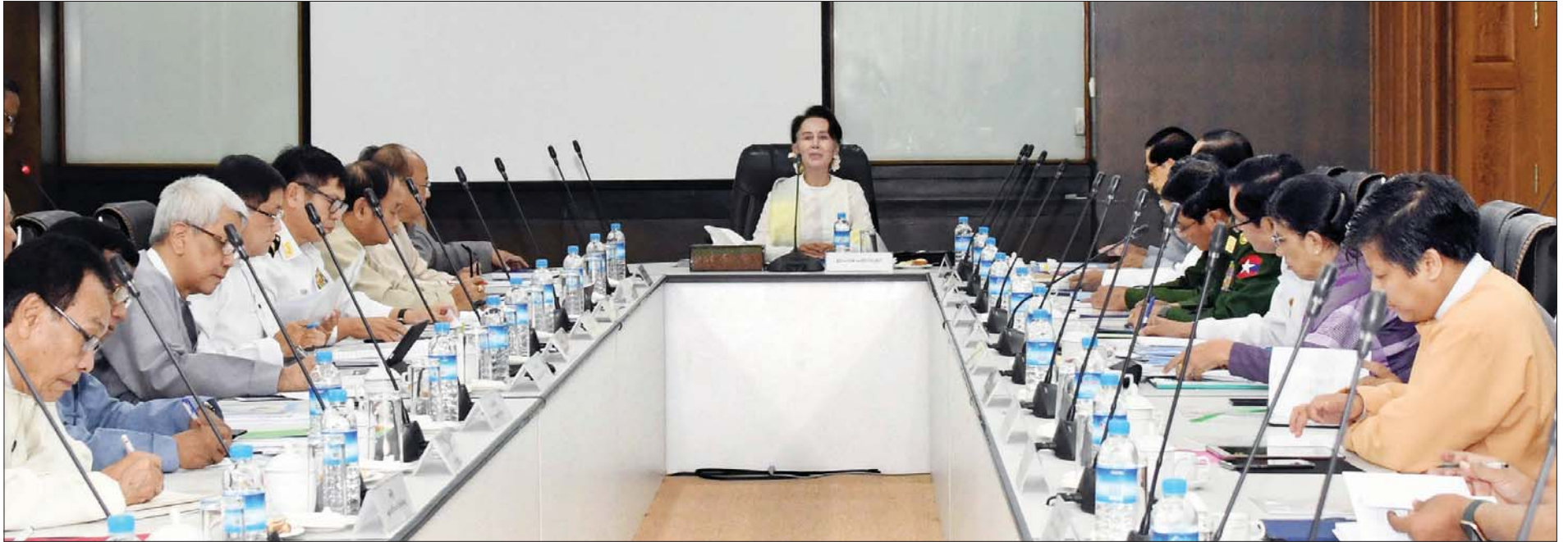
နိုင်ငံတော်၏ အတိုင်ပင်ခံပုဂ္ဂိုလ် ဒေါ်အောင်ဆန်းစုကြည် 2019 Novel Coronavirus(COVID-19) ကြောင့် ဖြစ်ပွားသော အဆုတ်ရောင်ရောဂါ ကာကွယ်၊ ထိန်းချုပ်၊ ကုသရေးဆိုင်ရာ အရေးပေါ်အစည်းအဝေးတွင် အမှာစကားပြောကြားစဉ်။ သတင်းစဉ်

နေပြည်တော် မတ် ၁၂ 2019 Novel Coronavirus (COVID-19) ကြောင့် ဖြစ်ပွားသော အဆုတ်ရောင်ရောဂါ ကာကွယ်၊ ထိန်းချုပ်၊ ကုသရေးဆိုင်ရာ အရေးပေါ်အစည်းအဝေးကို နိုင်ငံတော်၏ အတိုင်ပင်ခံပုဂ္ဂိုလ်မှ ဦးဆောင်၍ ယနေ့ မွန်းလွဲ ၂ နာရီတွင် နိုင်ငံခြားရေးဝန်ကြီးဌာန၌ ကျင်းပပြုလုပ်သည်။