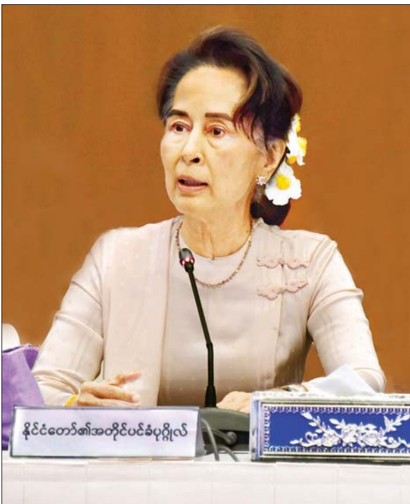
နိုင်ငံတော်၏အတိုင်ပင်ခံပုဂ္ဂိုလ် ဒေါ်အောင်ဆန်းစုကြည်

ဒီကနေ့ UPDJC အစည်းအဝေးကို တက်ရောက်လာကြတဲ့ အစိုးရ၊ လွှတ်တော်၊ တပ်မတော်အစုအဖွဲ့မှ ကိုယ်စားလှယ်များ၊ တိုင်းရင်းသား လက်နက်ကိုင်အဖွဲ့အစည်းများမှ ကိုယ်စားလှယ်များနဲ့ နိုင်ငံရေးပါတီများမှ ကိုယ်စားလှယ်များ အားလုံးပဲ ကိုယ်စိတ်နှလုံး အေးချမ်းကြပါစေကြောင်း ဆုမွန်ကောင်း ပို့သအပ်ပါတယ်။ ကျွန်မတို့ရဲ့ UPDJC လုပ်ဖော်ကိုင်ဖက်တွေ မဆုံရ၊ မတွေ့ရတာလည်း အတော်ကြာခဲ့ပါပြီ။ ပြီးခဲ့တဲ့ ၂၀၁၈ ခုနှစ်၊ ဇူလိုင်လ အတွင်းမှာ ကျင်းပခဲ့တဲ့ ပြည်ထောင်စုငြိမ်းချမ်းရေးညီလာခံ-(၂)ရာစုပင်လုံ၊ တတိယအစည်းအဝေးကာလအတွင်းက (၁၇)ကြိမ်မြောက် UPDJC အစည်း အဝေး ပြီးသွားတဲ့နောက်ပိုင်း ကျွန်မတို့ UPDJC အစည်းအဝေးတွေ မခေါ်နိုင် ခဲ့တာ အခုဆိုရင် အချိန်ကာလအားဖြင့် (၂)နှစ်နီးပါးအထိ ကြာမြင့်ခဲ့ပြီဖြစ်ပါ တယ်။ ဒီကနေ့ တရားဝင်အစည်းအဝေး ပြန်လည်စတင်နိုင်ပြီး UPDJC အဖွဲ့ ဝင်တွေအားလုံးနဲ့ ပြန်လည်တွေ့ဆုံရတဲ့အတွက်လည်း ဝမ်းမြောက်ဝမ်းသာ ဖြစ်ရပါတယ်။