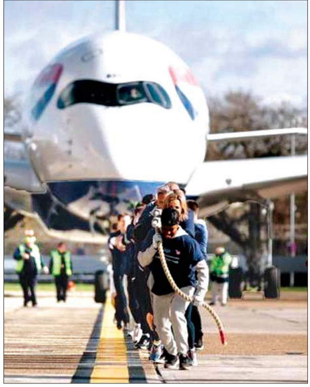
လေယာဉ်အမှုထမ်းများနှင့် အားကစားသမားများက လေယာဉ်ကိုကြိုးဖြင့်ဆွဲနေကြစဉ်။

၁၇ နှစ်ကြာ သုငယ်ချင်းအဖြစ် ခင်မင်လာသူနှစ်ဦးက ညီအစ်မအရင်းဖြစ်နေ လာတိုယာဝင်ဘာလေနဲ့ အင်္ဂလိပ်သောမတစ်စ်တို့ဟာ အလယ်တန်း ကျောင်းသူဘဝကတည်းက အခင်ဆုံးသူငယ်ချင်းတွေ ဖြစ်ခဲ့ကြတာပါ။ သူတို့ နှစ်ဦးကြားမှာ ကံတရားက ရိုက်ခတ်မှုကတော့ ဆန်းကြယ်လှပါတယ်။ ၁၇ နှစ် ကြာအချစ်ဆုံးသူငယ်ချင်းတွေအဖြစ်ရှိခဲ့ကြတဲ့သူတို့နှစ်ဦးဟာ ညီအစ်မအရင်း ခေါက်ခေါက်တွေ ဖြစ်နေတယ်ဆိုတာကို မထင်မှတ်ဘဲသိခဲ့ရခဲ့ပါတယ်။ အခု အခါမှာ အသက် ၃၁ နှစ် ရှိနေပြီဖြစ်တဲ့ သောမတစ်စ်ကတော့ ဒီအဖြစ်အပျက်ကို သိလျှင်သိချင်း သူညီဘက်အိပ်လိုတောင် မပျော်ခဲ့ဘူးလို့ ပြောပါတယ်။ ဝင်ဘာလေ ကတော့ အသက် ၂၉ နှစ်ရှိပါပြီ။ ဝင်ဘာလေကို ညီမအဖြစ် တော်စပ်ခွင့်ရတာကို ဝမ်းသာပေမယ့် သူ့ရဲ့အဖေအရင်းဟာ သူ့ဘေးနားမှာ