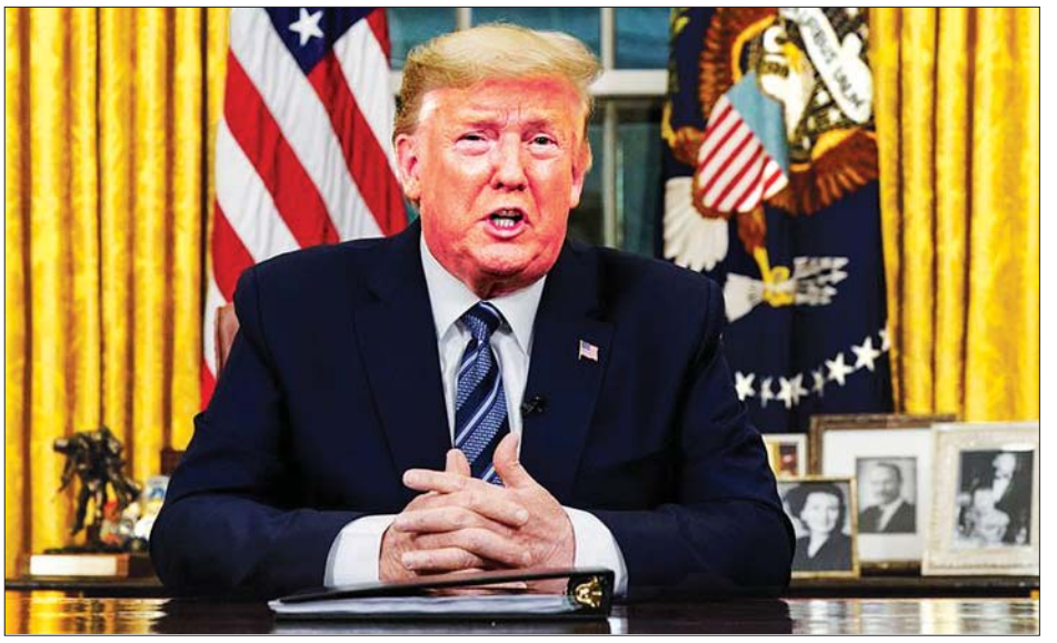
အမေရိကန်သမ္မတဒေါ်နယ်ထရမ်

အထည်ဖော်ခဲ့ကြောင်း ပြောကြားခဲ့သည်။ ထို့အပြင် အမေရိကန်သမ္မတဒေါ်နယ်ထရမ်က ကိုရိုနာဗိုင်းရပ်စ်ကြောင့်အထိနာခဲ့သော ကုမ္ပဏီများကို နောက်ထပ်ပံ့ပိုးမှုများ ပြုလုပ်ပေးသွားမည်ဖြစ်ကြောင်း ပြောကြားခဲ့သည်။ အမေရိကန်သမ္မတ ဒေါ်နယ်ထရမ်က လွတ်တော်ကို လုပ်ငန်းငယ်လေးများကို အတိုးနှုန်းနည်းနည်းနှင့် ချေးငွေထောက်ပံ့ပေးနိုင်ရန် အမေရိကန်ဒေါ်လာ ဘီလီယံ ၅၀ တိုးမြှင့်ပေးရန် တောင်းဆိုထားကြောင်းလည်း သိရသည်။ လေ့လာစောင့်ကြည့်သူများက အမေရိကန်သမ္မတ ဒေါ်နယ်ထရမ်သည် ငွေကြေးဈေးကွက်ကို အာမခံချက်ရှိရန်လုပ်ဆောင်နေပြီး ကိုရိုနာဗိုင်းရပ်စ်ကို လျှော့တွက်နေသည်ဆိုသည့် ဝေဖန်ချက်များကို ပျောက်ကွယ်အောင်ကြိုးစားနေသည်ဟု ပြောကြားလိုက်သည်။ အင်န်အိတ်ချ်ကော