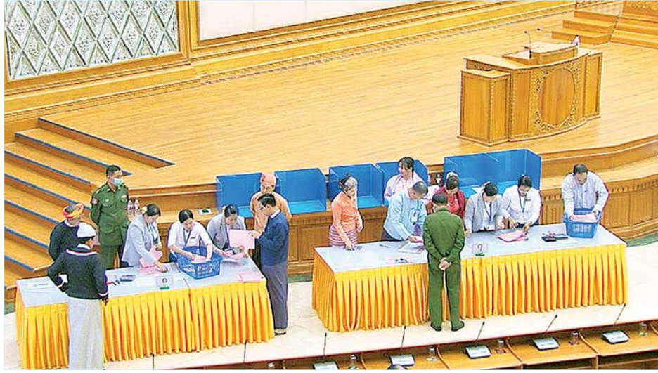
ဆန္ဒမဲလက်မှတ်များ ရေတွက်မှုနှင့် လွှတ်တော်ကိုယ်စားလှယ်များ ကြီးကြပ်စောင့်ကြည့်မှုကို တွေ့ရစဉ်။