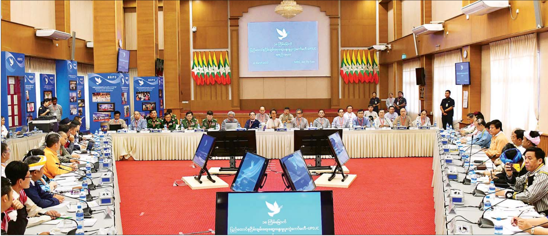
နိုင်ငံတော်၏အတိုင်ပင်ခံပုဂ္ဂိုလ် ဒေါ်အောင်ဆန်းစုကြည် (၁၈)ကြိမ်မြောက် ပြည်ထောင်စုငြိမ်းချမ်းရေးဆွေးနွေးမှုပူးတွဲကော်မတီ -UPDJC အစည်းအဝေးသို့ တက်ရောက်မိန့်ခွန်းပြောကြားစဉ်။ သတင်းစဉ်

နေပြည်တော် မတ် ၁၂ (၁၈)ကြိမ်မြောက် ပြည်ထောင်စုငြိမ်းချမ်းရေး ဆွေးနွေးမှုပူးတွဲကော်မတီ -UPDJC အစည်းအဝေးကို ယနေ့နံနက် ၁၀ နာရီတွင် နေပြည်တော်ရှိ အမျိုးသား ပြန်လည်သင့်မြတ်ရေးနှင့် ငြိမ်းချမ်းရေးဗဟိုဌာန (NRPC)၌ ကျင်းပရာ ပြည်ထောင်စုငြိမ်းချမ်းရေးဆွေးနွေးမှုပူးတွဲ ကော်မတီ- UPDJC ဥက္ကဋ္ဌ နိုင်ငံတော်၏အတိုင်ပင်ခံ ပုဂ္ဂိုလ် ဒေါ်အောင်ဆန်းစုကြည် တက်ရောက်မိန့်ခွန်း ပြောကြားသည်။ အစည်းအဝေးသို့ အစိုးရ၊ လွှတ်တော်၊ တပ်မတော်အစု အဖွဲ့မှ ပြည်ထောင်စုငြိမ်းချမ်းရေးဆွေးနွေးမှုပူးတွဲ ကော်မတီ ဒုတိယဥက္ကဋ္ဌများဖြစ်ကြသည့် ပြည်ထောင်စု