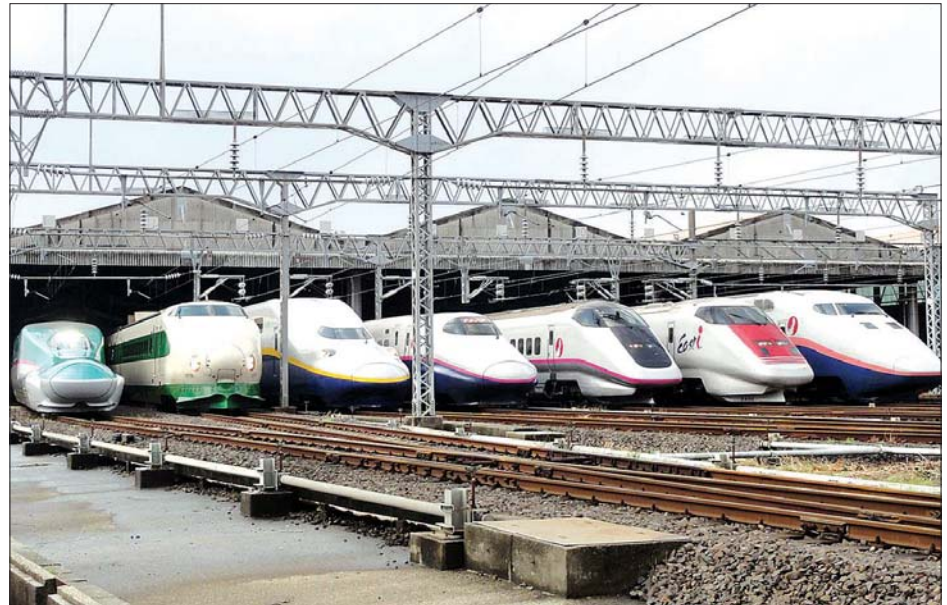
ရှင်ကန်ဆန် ကျည်ဆန်ရထားများကို တွေ့ရစဉ်။