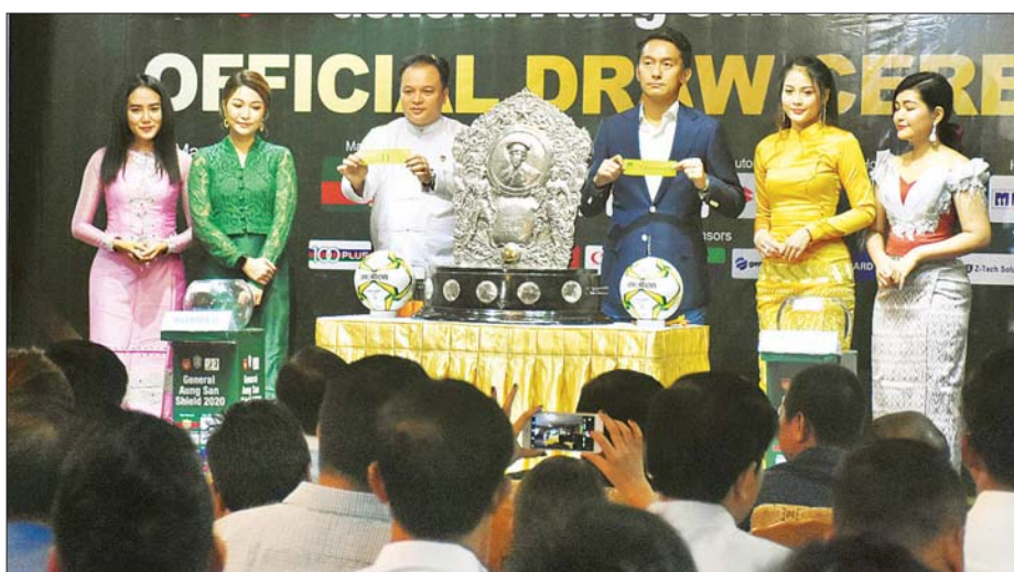
၂၀၂၀ ရာသီ ဗိုလ်ချုပ်အောင်ဆန်းခိုင်း ရှုံးထွက်ပြိုင်ပွဲ ပွဲစဉ်မဲနှိုက်ရေးဆွဲပွဲကျင်းပနေစဉ်။