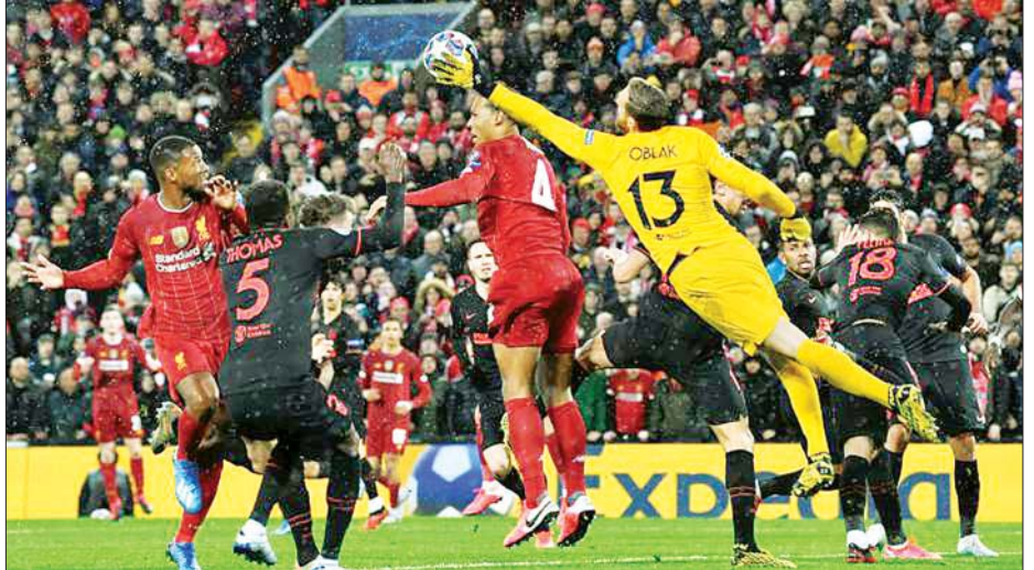
လီဗာပူးကစားသမားများ၏ ဂိုးသွင်းယူရန် ကြိုးပမ်းမှုကို အက်သလက်တီကိုမက်ဒရစ်ဂိုးသမား အော့ဘလက် ကာကွယ်ရန် ကြိုးပမ်းစဉ်။

ဒုတိယပိုင်းအစတွင်လည်း ဆာလာ၊ မာနေတို့၏ ကန်သွင်းချက်များကို အော့ဘလက်က အကောင်းဆုံး ကာကွယ်နိုင်ခဲ့သည်။ လီဗာပူးအသင်းသည် စာမျက်နှာ ၂၁ ကော်လံ ၃