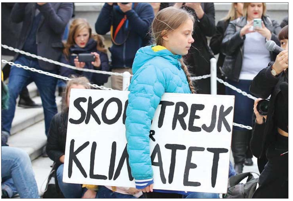
ဆွီဒင်နိုင်ငံမှ သဘာဝပတ်ဝန်းကျင်ဆိုင်ရာ တက်ကြွလှုပ်ရှားသူ ဆယ်ကျော်သက် ဂရိတာသွန်းဘတ်။

သူပညာရှင်များနှင့် သိပ္ပံပညာရှင်များ၏ လမ်းညွှန်ချက်များအတိုင်း လိုက်နာဆောင်ရွက်ကာ စည်းလုံးညီညွတ်စွာ ကြိုးပမ်းကြရမည်ဖြစ်ကြောင်း မတ် ၁၁ ရက်တွင် ဂရိတာသွန်းဘတ်က ပြောကြားခဲ့သည်။ ယခုအခါတွင် ကျွမ်းကျင်သူပညာရှင်များက လူထုစုဝေးမှုများ ရှောင်ရှားကြရန် တိုက်တွန်းလျက်ရှိသည်။ အများပြည်သူ သတိထားသိရှိစေမည့် နည်းလမ်းများကို ရှာဖွေရန်နှင့် လူထုစုဝေးမှုများအတွင်း ပါဝင်ခြင်းမရှိသည့် အပြောင်းအလဲကို အားပေးထောက်ခံရန် ရာသီဥတုအရေးတက်ကြွလှုပ်ရှားသူများကို ဂရိတာသွန်းဘတ်က တိုက်တွန်းခဲ့သည်။ အင်န်အိတ်ချ်ကော