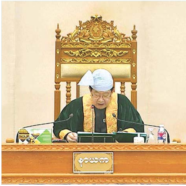
ပြည်ထောင်စုလွှတ်တော်နာယက ဦးတီခွန်မြတ်

ထို့နောက် ပြည်ထောင်စုလွှတ်တော် နာယက က လွှတ်တော်ကိုယ်စား လှယ်များထံ ထုတ်ပေးထားသည့် ဆန္ဒမဲလက်မှတ် ၆၃၃ စောင်ဖြစ်ပြီး ယခု ဆန္ဒမဲပေးအတွင်းမှ ထုတ်ယူရရှိသည့် ဆန္ဒမဲလက်မှတ်အရေအတွက်သည်လည်း