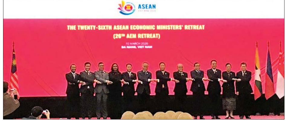
(၂၆) ကြိမ်မြောက် အာဆီယံစီးပွားရေးဝန်ကြီးများ သီးသန့်အစည်းအဝေး တက်ရောက်ကြသူများ စုပေါင်းမှတ်တမ်းတင် ဓာတ်ပုံရိုက်ကြစဉ်။