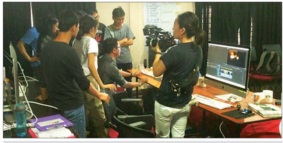
ဂျပန်နိုင်ငံမှ ရိုက်ကူးရေးအဖွဲ့ Yangon Film School တွင် သတင်းမှတ်တမ်း ရိုက်ကူးနေစဉ်။

လာသည့် အခြေအနေကို ပုဂ္ဂလိက ရုပ်ရှင်သင်တန်းကျောင်းဖြစ်သော YFSတွင် သင်ကြားနေမှုများအား အခြေခံရိုက်ကူးပြီး စိတ်ဝင်စားဖွယ် Documentary ပြသနိုင်ရန် ဆောင် ရွက်ခြင်းဖြစ်သည်။ အဆိုပါအဖွဲ့သည် မတ် ၁၃ ရက်မှ ၂၅ ရက်အတွင်း YFSတွင် ရိုက်ကူးမှု အပြင် မြန်မာ့ရုပ်ရှင်သမိုင်းပြတိုက်၊ သမ္မတရုပ်ရှင်ရုံ ပတ်ဝန်းကျင်နှင့် ကာတွန်းဦးဝင်းဖေ (အပျောက်)၏ ၎င်း၏ ကာတွန်းလက်ရာများကို ဆက်လက်ရိုက်ကူးမည်ဖြစ်ကြောင်း၊ ထိုသို့ ရိုက်ကူးထားရှိမှုများကို NHK အသံလွှင့်ဌာန၏ NHK World Channel တွင် ထုတ်လွှင့်ပြသမည် ဖြစ်ကြောင်း သိရသည်။ ဝင်းထိန်(FDC)