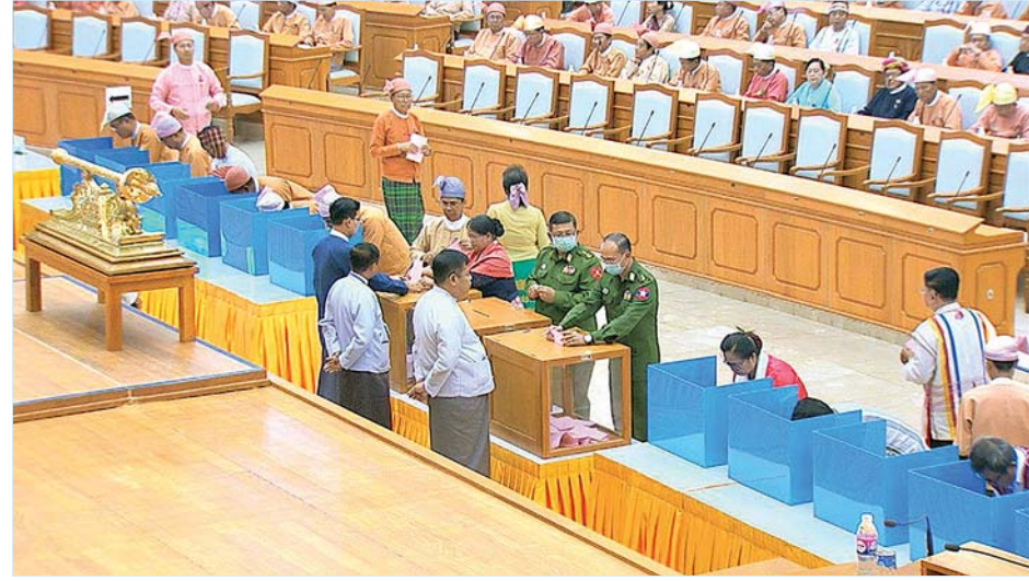
ပြည်ထောင်စုလွှတ်တော်ကိုယ်စားလှယ်များ လျှို့ဝှက်ဆန္ဒပြုခြင်းနည်းလမ်းဖြင့် ဆန္ဒမဲပေးကြစဉ်။

အောင်ရဲသွင်၊ အေးအေးသန့်