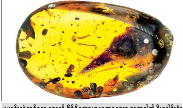
ပယင်းထဲတွင်တွေ့ရသည့် ခိုင်ခိုင်ဆောဟုယူဆရသော သတ္တဝါ၏ ဦးခေါင်းခွံ။

မျက်ရည်ပုံသဏ္ဍာန်ရှိသည့်ကြယ်ကို အပျော်တမ်းနက္ခတ္တဗေဒပညာရှင်များ ရှာဖွေတွေ့ရှိ ကြယ်တွေဆီမှာ ထူးခြားမှုတစ်ခုခု ရှိနေပြီဆိုရင် နက္ခတ္တဗေဒပညာရှင်တွေ ကတန်းပြီး သတိပြုမိတတ်ကြပါတယ်။ HD74423 လို့ အမည်ရတဲ့ ကြယ်ရဲ့ ထူးခြားမှုဖြစ်စဉ်ကိုတော့ အပျော်တမ်းနက္ခတ္တဗေဒပညာရှင်တွေက သတိပြုမိ ခဲ့ကြပါတယ်။ နာဆာရဲ့နောက်ဆုံးပေါ် ပြုပြင်မှုတွေအားဖြင့် အာကာသပြုတ်ကုန် နေ့စွဲတွေရှိခဲ့တာပါ။ အဲဒီကြယ်ရဲ့ပုံစံဟာထူးဆန်းနေတာကို သူတို့သတိထား မိခဲ့ကြပါတယ်။ အဲဒီကြယ်ဟာ ကမ္ဘာမြေနဲ့အလင်းနှစ် ၁၅၀၀ အကွာမှာတည်ရှိပြီး အဲဒီကြယ်ဟာ ဓာတုဗေဒနည်းအရ ထူးခြားတဲ့ကြယ်တစ်လုံးဆိုတာကို သိရှိခဲ့ကြ ပါတယ်။ ကြယ်တွေမှာ ပုံမှန်အားဖြင့် သတ္တုကြွယ်ဝပါတယ်။ ဒီကြယ်မှာတော့ သတ္တုနည်းပါးတာကို တွေ့ရပါတယ်။ ဒါကြောင့်လည်း ရှားပါးတဲ့ပုံစံဖြစ်နေရ တာပါ။ အဲဒီကြယ်ဟာ နေနဲ့ နှိုင်းယှဉ်မယ်ဆိုရင် ထုထည်အားဖြင့် ၁ ဒဿမ ၇ ဆ ရှိပါတယ်။ ဗလစ်ဘူတီဒေါ့ကွန်း