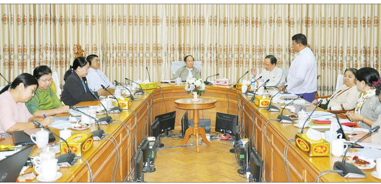
COVID-19 ရောဂါကာကွယ်ထိန်းချုပ်ရေးဗဟိုအဆင့် ညှိနှိုင်းအစည်းအဝေး (၃၃/ ၂၀၂၀) ကျင်းပစဉ်။ သတင်းစဉ်

လွန်ခဲ့သော နှစ်ပတ်တာကာလအတွင်း တရုတ်ပြည်သူ့သမ္မတနိုင်ငံပြင်ပ၌ COVID-19 ရောဂါ ဖြစ်ပွားမှုသည် ၁၃ ဆခန့် မြင့်တက်လာပြီး ဖြစ်ပွားသော နိုင်ငံအရေအတွက်မှာလည်း သုံးဆတက်လာသည်ကို တွေ့ရှိရပါကြောင်း၊ ရောဂါကာကွယ်ထိန်းချုပ်ရေးလုပ်ငန်းများ ဆောင်ရွက်ရာ၌ ဤအချက်ကို မိမိတို့အနေဖြင့် အထူးသတိထား၍ နောက်ခံထားစဉ်းစားရမည်ဖြစ်ပါကြောင်း၊ အီတလီ၊ အီရန်နှင့် ကိုရီးယားသမ္မတနိုင်ငံ အစရှိသည့်နိုင်ငံများ၌ ရောဂါပျံ့နှံ့မှုများသည် ရုတ်တရက် များပြားစွာဖြစ်ပေါ်လာခြင်းဟူသော အချက်သည် ကပ်ရောဂါဗေဒရှုထောင့်မှ အထူးအရေးကြီးသည့် အချက်တစ်ချက်ဖြစ်ပြီး မိမိတို့နိုင်ငံတွင် ၎င်းတို့ကဲ့သို့ မဖြစ်စေရေး အားလုံးပိုင်းဝန်း