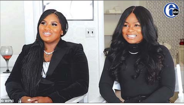
၁၇ နှစ်ကြာမှ ညီမအရင်းတစ်ဖွဲ့သိရှိခဲ့ရသည့် အင်္ဂလိပ်သောမတစ်စ် (ယာ)နှင့် လာတိုယာဝင်ဘာလေ(ဝဲ) တို့ကိုတွေ့ရစဉ်။

အားကစားသမားများနှင့် လေယာဉ်အမှုထမ်းများက ၂၀၁၃ ခုနှစ် တန်ခူးလဆန်းပိုင်းက ချိန်ရှိသည့် လေယာဉ်ကို ကြိုးဖြင့်ဆွဲကာ ကမ္ဘာ့စံချိန်တင်ရန်ကြိုးပမ်း ဗြိတိန်အစိုးရကြောင်းလှိုင်းက အမှုထမ်းတွေနဲ့ နာမည်ကျော်အားကစား သမားအချို့ဟာ အုပ်စု ဖွဲ့ပြီး ၂၀၁၃ ခုနှစ် တန်ခူးလဆန်းပိုင်းက လေယာဉ်ပျံကို ၃၂၈ မီတာအထိ ကြိုးနဲ့ဆွဲပြီး ဂရင်းနက်စ်စံချိန်တင်ဖို့ကြိုးပမ်းခဲ့ကြတာကို တွေ့ရ ပါတယ်။ နာမည်ကျော်အားကစားသမားတွေနဲ့ လေယာဉ်အမှုထမ်းတွေဟာ ဗြိတိန်အစိုးရ အေ ၃၅၀ လေယာဉ်ကို ဆွဲပြီး ကမ္ဘာ့စံချိန်ချိန်းခဲ့ပါတယ်။ အရင်စံချိန်တင်ထားတဲ့လေယာဉ်ရဲ့ အလေးချိန်ကတော့ ၁၉၈ ဒီဇင်ဘာ ၄ တန်ခူး ရှိပါတယ်။ ဗြိတိန်အစိုးရကြောင်းလှိုင်းဟာ Comic Relief ဆိုတဲ့ လူမှုရေးအသင်းနဲ့ မိတ်ဖက်ပြုလုပ်ထားပြီး ချို့တဲ့သောကလေးငယ်များ ဘဝသစ်စီမံရေးအကူအညီ ပေးနေတဲ့ flying Start ဆိုတဲ့ အစီအစဉ်တစ်ခု ပြုလုပ်ထားပါတယ်။ အခုပြု လုပ်တဲ့ပွဲကတော့ အားကစားရန်ပုံငွေရရှိအောင် လှူဒါန်းမှုတစ်ရပ်အနေနဲ့ အခုလို လုပ်ဆောင်ခဲ့တာလည်း ဖြစ်ပါတယ်။ ယူပီအိုင်ဒေါ့ကွန်း