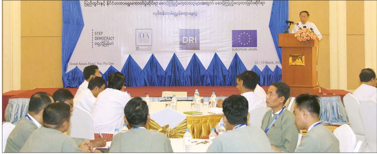
ပြည်ထောင်စုရွေးကောက်ပွဲကော်မရှင်ဥက္ကဋ္ဌ ဦးလှသိန်း ပြည်တွင်းနှင့် နိုင်ငံတကာ ရွေးကောက်ပွဲစောင့်ကြည့်လေ့လာသူများအတွက် စောင့်ကြည့်လေ့လာ ခြင်းဆိုင်ရာ လုပ်ငန်းလမ်းညွှန်နှင့်စပ်လျဉ်းသည့် ဆွေးနွေးပွဲတွင် အမှာစကားပြောကြားစဉ်။