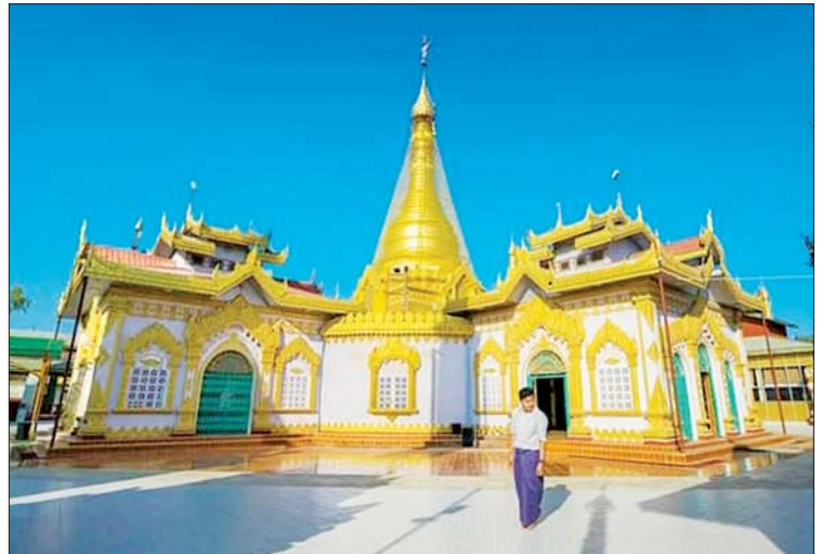
ပခန်းကြီး စည်သူရှင်ဘုရား။

သန့်ပြီး သဘာဝပတ်ဝန်းကျင်ထိန်းသိမ်းတဲ့ အနေနဲ့ ရေဘူးကို ပြန်ဖြည့်တဲ့ရေဘူးလေးတွေ သုံးထားတယ်။ မီးခံသေတ္တာကလည်း သံသေတ္တာကို သေ့ခလောက်နဲ့ အလန်းကြီး။ ဟိုတယ်ရဲ့ အလယ်က ဟင်းလင်း လဟာ။