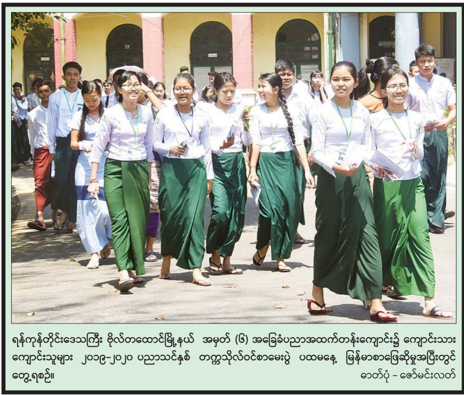
ရန်ကုန်တိုင်းဒေသကြီး ဗိုလ်တထောင်မြို့နယ် အမှတ် (၆) အခြေခံပညာအထက်တန်းကျောင်း၌ ကျောင်းသားကျောင်းသူများ ၂၀၁၉-၂၀၂၀ ပညာသင်နှစ် တက္ကသိုလ်ဝင်စာမေးပွဲ ပထမနေ့ မြန်မာစာဖြေဆိုမှုအပြီးတွင်

အဖွဲ့ဝင်များ၊ ဌာနဆိုင်ရာများမှ တာဝန်ရှိသူများ တက်ရောက်ကြသည်။ အစည်းအဝေးတွင် ဒုတိယသမ္မတ ဦးဟင်နရီဗန်ထီးယူက အမျိုးသားအဆင့် ရေအရင်းအမြစ်ကော်မတီကို ဖွဲ့စည်းပြီးနောက် ရေနှင့်ဆက်သွယ်သည့် ကဏ္ဍများ ဖွံ့ဖြိုးတိုးတက်စေရန်၊ ရေအရင်းအမြစ်များကို ထိရောက်စွာ စီမံခန့်ခွဲရေးနှင့် အကျိုးရှိစွာအသုံးပြုနိုင်ရန်၊ နိုင်ငံတကာ အဖွဲ့အစည်းများနှင့် စာမျက်နှာ ၈ ကော်လံ ၁ □