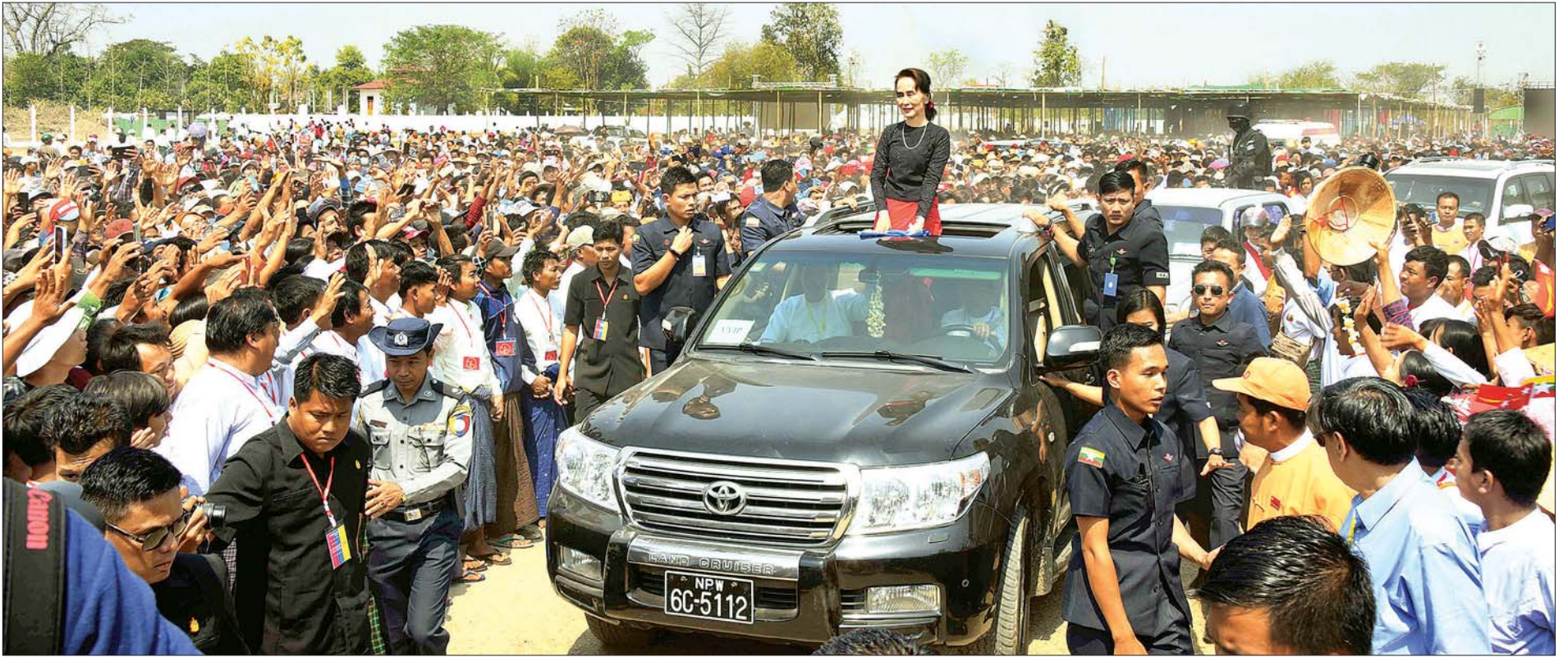
နိုင်ငံတော်၏အတိုင်ပင်ခံပုဂ္ဂိုလ် ဒေါ်အောင်ဆန်းစုကြည်အား ဒီပဲယင်းမြို့ရှိ ဒေသခံပြည်သူများက သောင်းသောင်းဖြူဖြူဆိုကြစဉ်။