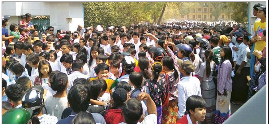
စစ်ကိုင်းတိုင်းဒေသကြီး မုံရွာစာစစ်ဌာန၌ စာမေးပွဲဖြေဆိုအပြီး ပြန်ထွက်လာသည့် ကျောင်းသား ကျောင်းသူများ နှင့် လာရောက်ကြိုဆိုသည့် မိသားစုများကို တွေ့ရစဉ်။ မွေးကြူမြေ