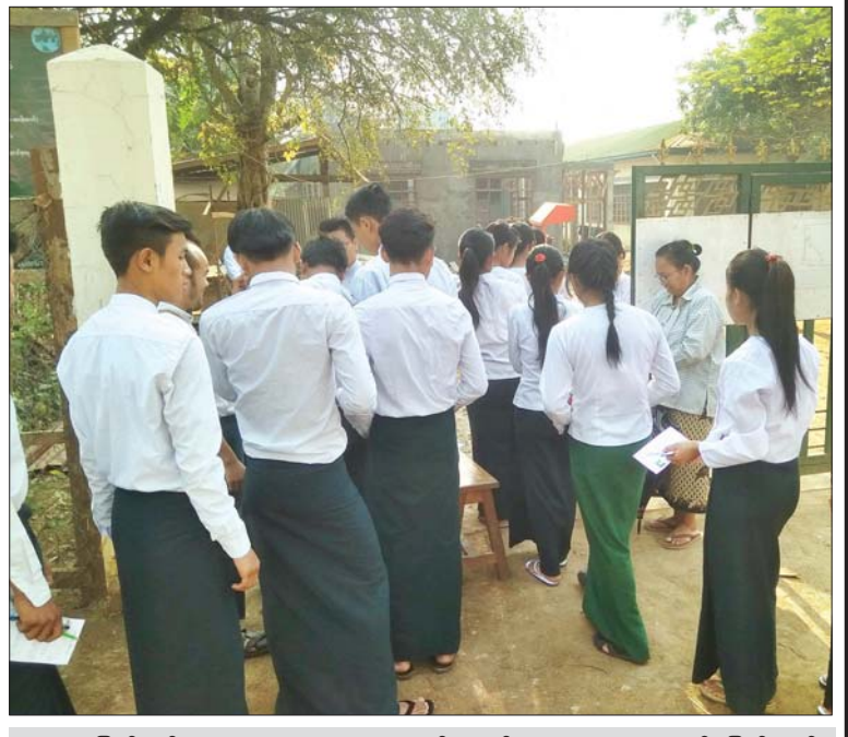
ကယားပြည်နယ် အထက(ရှားတော) စာစစ်ဌာနသို့ စာမေးပွဲလာရောက်ဖြေဆိုသည့် ကျောင်းသား ကျောင်းသူများကို တွေ့ရစဉ်။ ထွန်းအောင်(ပြန်ဆက်)