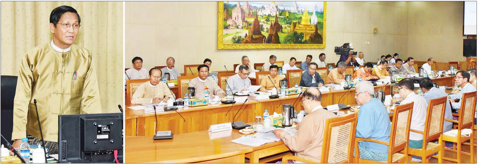
ဒုတိယသမ္မတ ဦးဟင်နရီဗန်ထီးယူ အမျိုးသားအဆင့် ရေအရင်းအမြစ်ကော်မတီ၏ ရှေ့လုပ်ငန်းစဉ် ညှိနှိုင်းအစည်းအဝေး (၁/၂၀၂၀) တွင် အမှာစကားပြောကြားစဉ်။