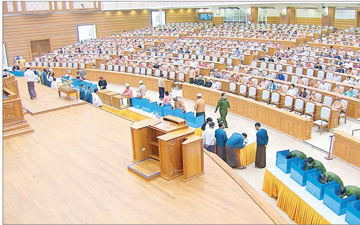
ပြည်ထောင်စုလွှတ်တော်ကိုယ်စားလှယ်များ လျှို့ဝှက်ဆန္ဒပြုခြင်းနည်းလမ်းဖြင့် ဆန္ဒမဲပေးကြစဉ်။

ယင်းနောက် ပြည်ထောင်စုလွှတ်တော် နာယက က ဖွဲ့စည်းပုံအခြေခံဥပဒေကို ဒုတိယအကြိမ် ပြင်ဆင်သည့် ဥပဒေမူကြမ်းများပါ ဖွဲ့စည်းပုံအခြေခံဥပဒေပုဒ်မ