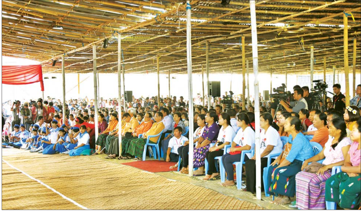
နိုင်ငံတော်၏အတိုင်ပင်ခံပုဂ္ဂိုလ် ဒေါ်အောင်ဆန်းစုကြည် ဒီပဲယင်းမြို့၊ မြို့နယ်အားကစားကွင်း၌ ဒေသခံပြည်သူများအား တွေ့ဆုံအမှာစကားပြောကြားစဉ်။