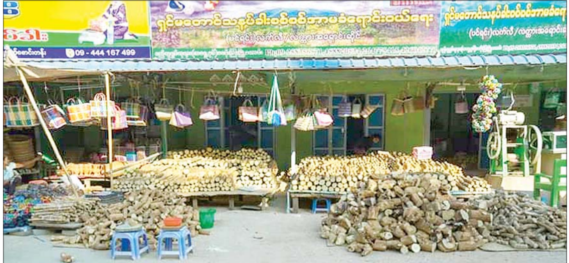
ရှင်မတောင်သနပ်ခါးအရောင်းဆိုင်။

ရိုက်ချင်လို့ နေရာရှာချင်တာလား။ သမိုင်းဗဟုသုတလား သူက အကုန်တာဝန်ယူလုပ်ပေးနိုင်တယ်။ သူ့ဆီ အကုန်ပုံအပ်လိုက်ရင်လည်း ရတယ်။ သူက နိုင်ငံခြားသားတွေအတွက်ရော ပြည်တွင်းခရီးသွားတွေအတွက်ပါ အကုန်စီစဉ်ပေးနိုင်သူပါနော်။ အညာမြေလတ်ဒေသ တစ်ခုဖြစ်တဲ့ ပခုက္ကူမြို့ကို အရင်က ထူးထူးလည်လည်ပတ်ပတ် ရှိမယ် မထင်မိခဲ့ပေမယ့် တကယ်တမ်း ရောက်သွားတဲ့အခါမှာ သမိုင်းအမွေအနှစ်တွေရှိရာ လေ့လာစရာ မြို့တစ်မြို့အဖြစ် ထူးခြားစွာ ကျွန်တော် မြင်ခဲ့ရပါတယ်။ နိုင်ငံခြားသားတွေလည်း ဝင်ထွက်သွားလာနေတဲ့ မြို့လေးဖြစ်နေသလို ပုဂံနဲ့လည်း မဝေးလို့ လာချင်ရင် အနီးလေး လာလည်နိုင်တဲ့နေရာကောင်းလေးမှာ တည်ရှိပါတယ်။ ကျွန်တော်ကတော့ နောက်များအခါ အခွင့်သင့်ခဲ့ရင် ခုလိုနှစ်ရက်တာထက်ပိုပြီး အချိန်ကြာကြာလေးနေလို့ အနီးအပါးရွာတွေမှာ လေ့လာရေးဆင်းချင်ပါသေးတယ်ဗျာ။ အားလုံးပဲ အစဉ်ဘေးကင်းလုံခြုံကျန်းမာ ပြည့်စုံပျော်ရွှင်စွာနဲ့ ခရီးသွားနိုင်ကြပါစေ။