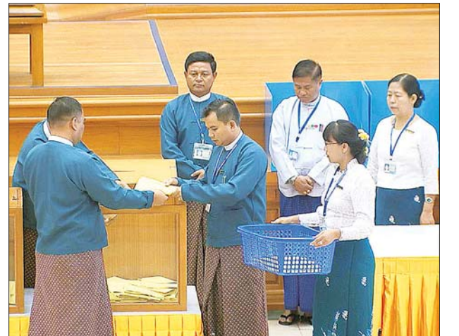
ဆန္ဒမဲလက်မှတ်များ ရေတွက်စဉ်။

ထို့နောက် ပြည်ထောင်စုလွှတ်တော်နာယက က ယနေ့လွှတ်တော်၏ အဆုံးအဖြတ်ရယူသည့် ဥပဒေမူကြမ်းပြင်ဆင်ချက် ပုဒ်မ၊ ပုဒ်မခွဲအလိုက် ထောက်ခံဆန္ဒမဲ ရရှိမှု အရေအတွက် ၇၅ ရာခိုင်နှုန်းကျော် ရ မရနှင့် လွှတ်တော် ၏ အဆုံးဖြတ်ချက်တို့ကို အတည်ပြု ကြေညာရာတွင် ပုဒ်မ ၅၉ ပုဒ်မခွဲ(ဂ) ပြင်ဆင်မှု