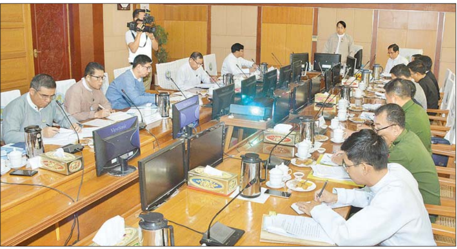
ပြည်ထောင်စုဝန်ကြီး ဒေါက်တာဖေမြင့်၊ စတုတ္ထအကြိမ် မဏ္ဍိုင်(၄)ရပ် အလုပ်ရုံဆွေးနွေးပွဲ ပထမအကြိမ်အကြံပြု တွေ့ဆုံညှိနှိုင်းအစည်းအဝေးတွင် အမှာစကားပြောကြားစဉ်။ သတင်းစဉ်

အစည်းအဝေးသို့ ပြန်ကြားရေး ဖြည့်ဆည်းရန်၊ သတင်းမီဒီယာသမား ဝန်ကြီးဌာန ပြည်ထောင်စုဝန်ကြီး များ၏ ရပိုင်ခွင့်နှင့် လွတ်လပ်ခွင့် ဒေါက်တာဖေမြင့်၊ ဒုတိယဝန်ကြီး များ အပြည့်အဝရရှိစေရန်အတွက် ဦးအောင်လှထွန်း၊ အမြဲတမ်းအတွင်း အုပ်ချုပ်ရေးမဏ္ဍိုင်၊ ဥပဒေပြုရေး ဝန် ဦးမျိုးမြင့်မောင်နှင့် ဌာနဆိုင်ရာ မဏ္ဍိုင်၊ တရားစီရင်ရေးမဏ္ဍိုင်တို့ အကြီးအကဲများ၊ ပြည်ထောင်စုတရား နှင့် သတင်းမီဒီယာသမားများအကြား လွှတ်တော်ချုပ်ရုံး၊ ပြည်ထောင်စု ဝန်ကြီးဌာန၊ တပ်မတော်သတင်းမှန် ပြန်ကြားရေးအဖွဲ့တို့မှ တာဝန်ရှိသူများ တက်ရောက်ကြသည်။ တွေ့ဆုံဆွေးနွေး အဖြေရှာရန် အသိအမှတ်ပြု လက်ခံကာ ပူးပေါင်း ညှိနှိုင်းခြင်းဖြင့် ပိုမိုပိုင်ခွင့်မြင်သာ မှုရှိသည့် ပြည်သူ့အကျိုးပြုစနစ် Good Governance ပေါ်ထွန်းရေး အတွက် အထောက်အကူပြုရန်နှင့် တတိယအကြိမ် မဏ္ဍိုင် (၄) ရပ် အလုပ်ရုံဆွေးနွေးပွဲမှ ရလဒ်များအား ပြန်လည်သုံးသပ်ရန်အတွက် ဖြစ် ပါကြောင်း။