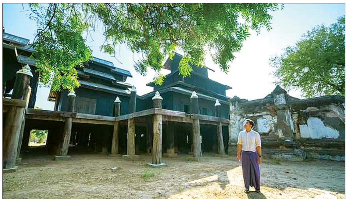
ပခန်းဘုန်းတော်ကြီးကျောင်း။

ကျွန်တော်ကတော့ ပုဂံကို လာရင်း လာလည်တာမို့ ပုဂံမှာပဲ တည်းပါတယ်။ ကျွန်တော် အမြဲတည်းဖြစ်တဲ့ Bagan View Hotel (ပုဂံရှုခင်းဟိုတယ်) မှာပဲ တည်းဖြစ်တယ်။ အကြောင်းက ဖော်ရွေတယ်။ မနက်စာဘူဖေး အတော်ကောင်းတယ်။ အခန်းက