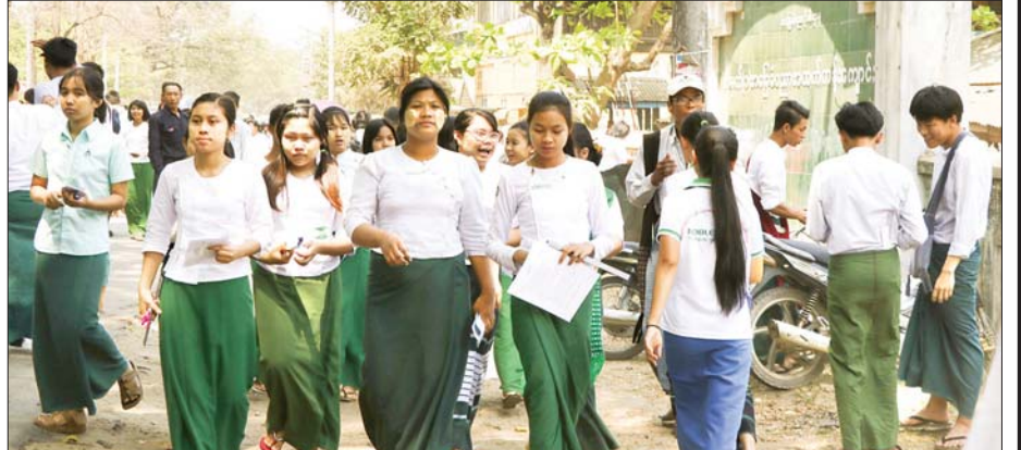
ပဲခူးတိုင်းဒေသကြီး အထက(၁) တောင်ငူ စာစစ်ဌာန၌ စာမေးပွဲဖြေဆိုပြီးသည့် ကျောင်းသား ကျောင်းသူများကို တွေ့ရစဉ်။ သူရ(တောင်ငူ)