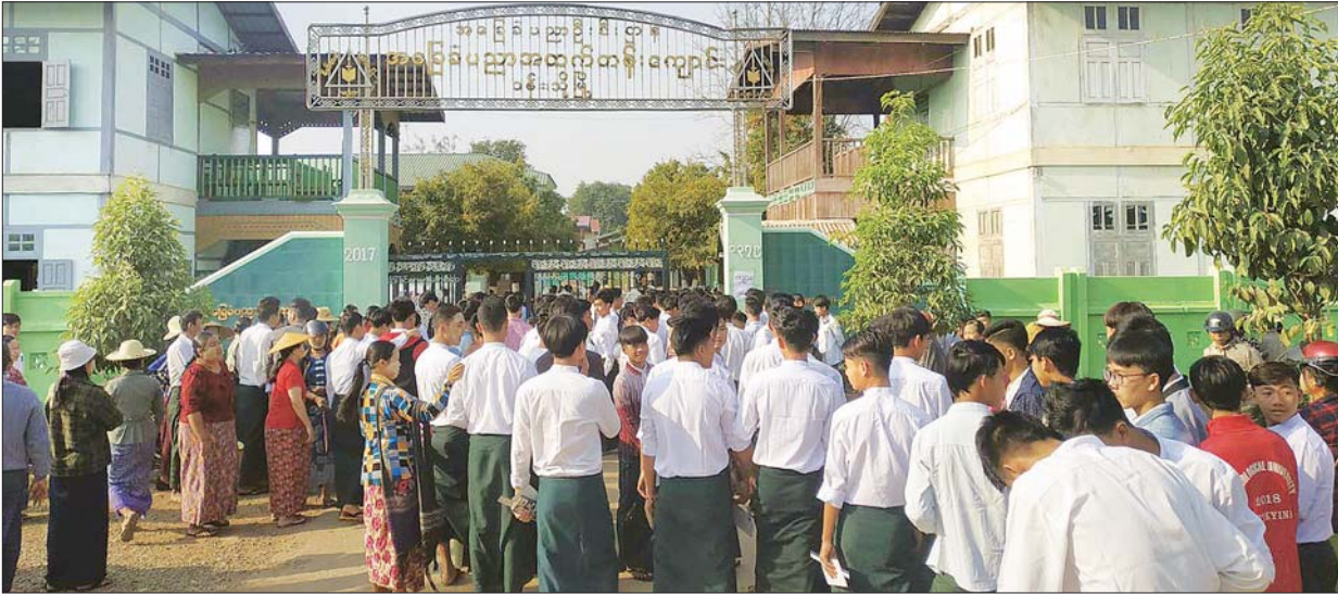
စစ်ကိုင်းတိုင်းဒေသကြီး ဝန်းသိုမြို့နယ် အခြေခံပညာအထက်တန်းကျောင်းသို့ စာမေးပွဲဖြေဆိုရန် လာရောက်သည့် ကျောင်းသား ကျောင်းသူများ ကို တွေ့ရစဉ်။