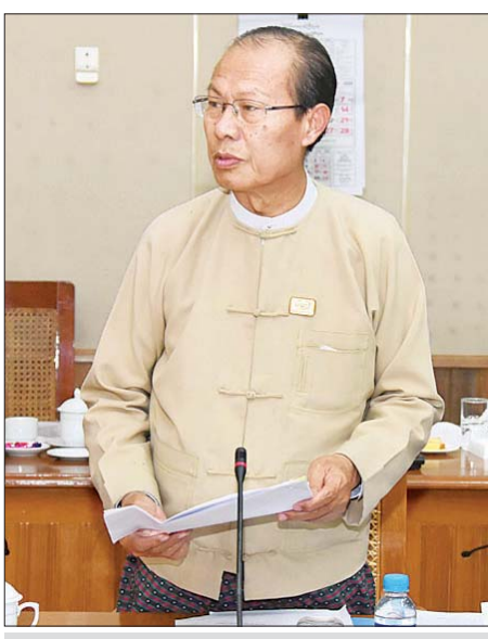
နေပြည်တော်ကောင်စီဥက္ကဋ္ဌ ဒေါက်တာမျိုးအောင်