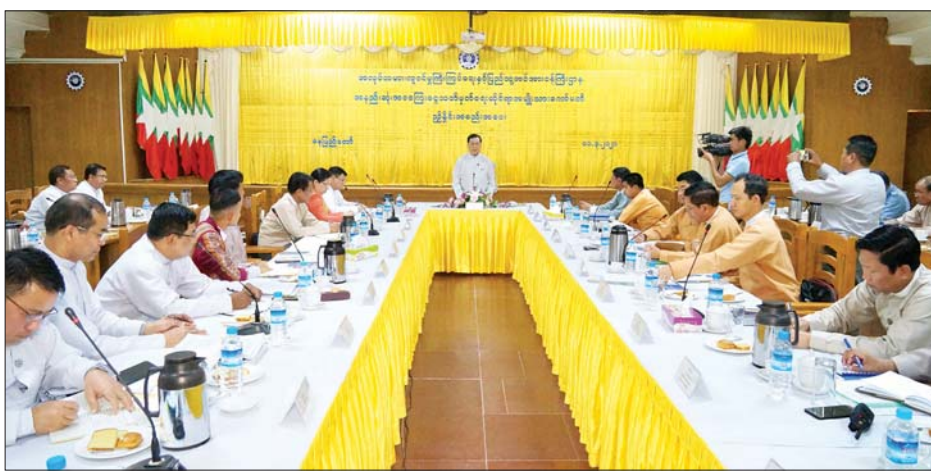
ပြည်ထောင်စုဝန်ကြီး ဦးသိန်းဆွေ အနည်းဆုံးအခကြေးငွေ သတ်မှတ်ရေးဆိုင်ရာ အမျိုးသားကော်မတီ ညှိနှိုင်းအစည်းအဝေးတွင် အမှာစကားပြောကြားစဉ်။ သတင်းစဉ်

အလုပ်သမားများနှင့် တွေ့ဆုံပြီး ဆောင်ရွက်ချက်များကို တင်ပြရန် လိုအပ်ကြောင်း၊ အနည်းဆုံး အခကြေးငွေ သတ်မှတ်ရေးဆိုင်ရာ အမျိုးသားကော်မတီဝင်များ၊ ပြည်ထောင်စုနယ်မြေ၊ တိုင်းဒေသကြီး၊