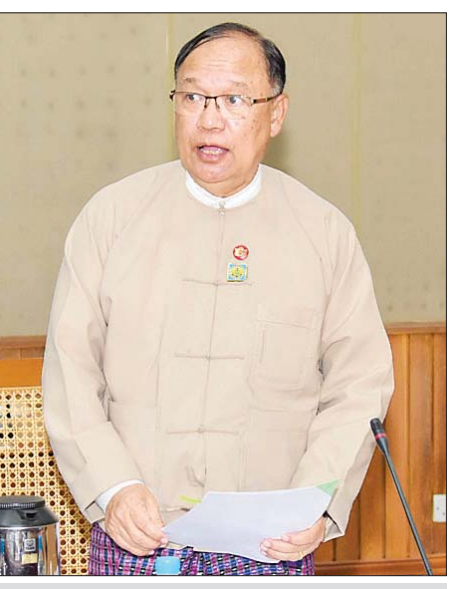
ပြည်ထောင်စုဝန်ကြီး ဦးသန့်စင်မောင်

မိမိတို့ကော်မတီအနေဖြင့် အမျိုးသားရေဥပဒေ ပေါ်ပေါက်ရေးအတွက် ကော်မတီ၏ အကြံပေးအဖွဲ့နှင့် Task Force အဖွဲ့တို့က ဆောင်ရွက်လျက်ရှိရာ ဥပဒေမူကြမ်းအား အင်္ဂလိပ်ဘာသာဖြင့် ပြုစုပြီးဖြစ်ပြီး မြန်မာဘာသာသို့ ပြန်ဆိုလျက်ရှိပါကြောင်း၊ နိုင်ငံအတွက် အရေးတကြီးလိုအပ်နေသည့် အမျိုးသားရေဥပဒေပြဋ္ဌာန်းနိုင်ရေးအတွက် အချိန်မီပြီးစီးအောင် ဆက်လက်ဆောင်ရွက်သွားကြရမည်ဖြစ်ပြီး တည်ဆဲဥပဒေများ၊ နည်းဥပဒေများနှင့်