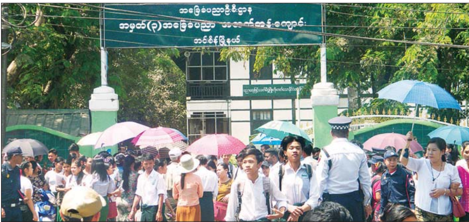
ရန်ကုန်တိုင်းဒေသကြီး အထက(၃) အင်းစိန်၌ စာမေးပွဲဖြေဆိုအပြီး ပြန်ထွက်လာသည့် ကျောင်းသား ကျောင်းသူများ နှင့် လာရောက်ကြိုဆိုသည့် မိသားစုများကို တွေ့ရစဉ်။ ညွှတ်လင်း