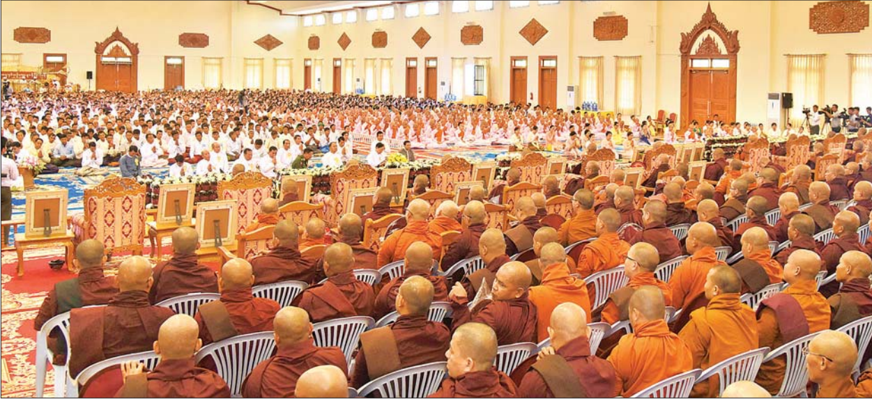
(၃၄)ကြိမ်မြောက် မဟာဘွဲ့နှင့်သဘင် အခမ်းအနား ကျင်းပစဉ်။ သတင်းစဉ်

နေပြည်တော် မတ် ၁၁ သာသနာရေးနှင့် ယဉ်ကျေးမှုဝန်ကြီးဌာနက ကြီးမှူးကျင်းပသော (၃၄)ကြိမ်မြောက် မဟာဘွဲ့နှင့်သဘင်အခမ်းအနားကို ယနေ့ မွန်းတည့် ၁၂ နာရီတွင် နေပြည်တော် ဥပုတေသနီစေတီတော် ပရိဝုဏ်အတွင်းရှိ သာသနာ့ မဟာဗိမာန်တော်ကြီး၌ ကျင်းပသည်။