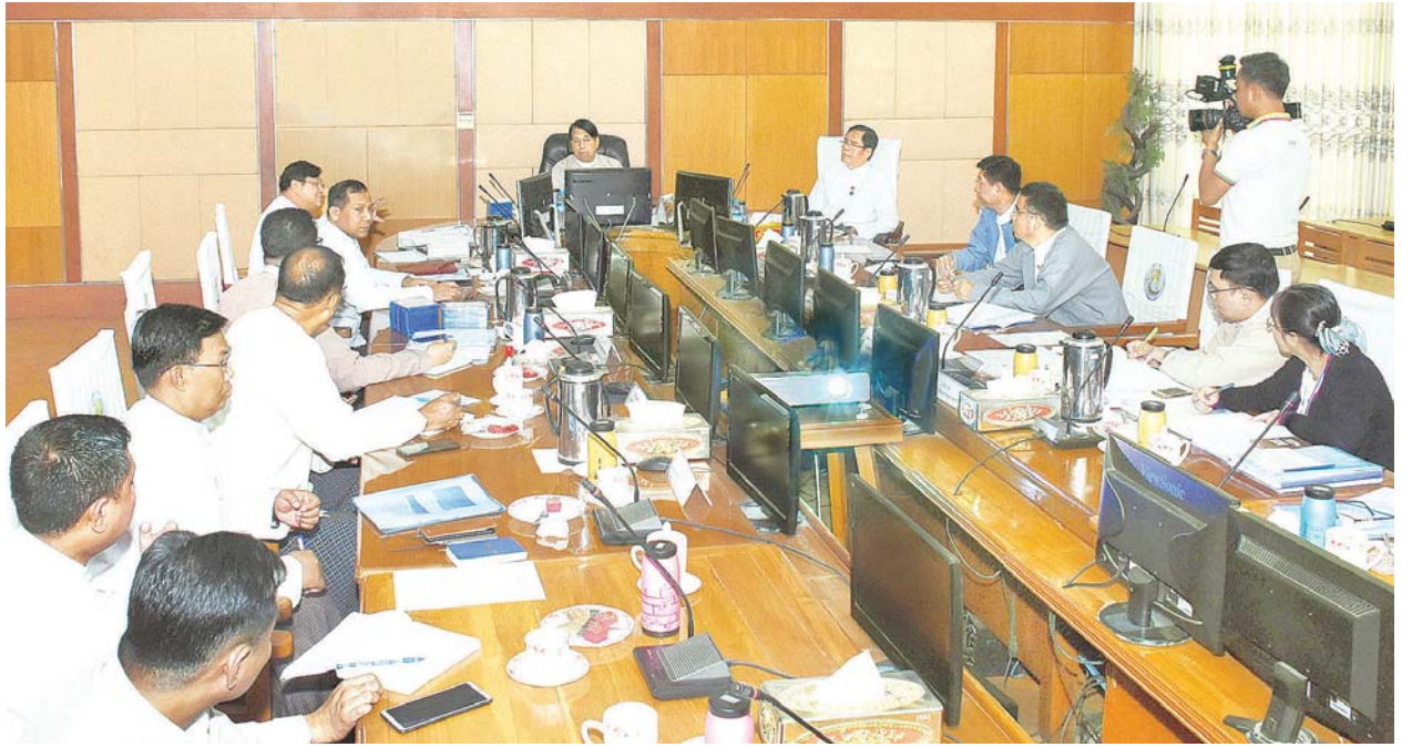
၂၀၂၀ ပြည့်နှစ် ပါတီစုံဒီမိုကရေစီ အထွေထွေရွေးကောက်ပွဲကြီးအတွက် မဲပေးနိုင်ရေးပညာပေးရန် ညှိနှိုင်းအစည်းအဝေး ကျင်းပစဉ်။ သတင်းစဉ်

ယင်းနောက် ပြည်ထောင်စုဝန်ကြီး ဒေါက်တာဖေမြင့်က ပြည်ထောင်စုရွေးကောက်ပွဲကော်မရှင်က ချမှတ်ထားသော မီဒီယာနှင့် သက်ဆိုင်သည့် လမ်းညွှန်ချက်များကို လိုက်နာနိုင်ရေး စုစည်းပြုစုထားရန်၊ ရွေးကောက်ပွဲနှင့် စပ်လျဉ်းသည့် သိချင်းများ၊ ပညာပေးအစီအစဉ်များ၊ အင်တာဗျူးများကို စိတ်ဝင်စားဖွယ်ဖြစ်အောင် ဆောင်ရွက်သွားရန်နှင့် ယင်းတို့အား စောနိုင်သမျှ ဆောလျင်စွာဆောင်ရွက်နိုင်ရေး ပြင်ဆင်ရန်နှင့်စပ်လျဉ်း၍ ဆွေးနွေးပြီး နိဂုံးချုပ်အမှာစကား ပြောကြားခဲ့သည်။