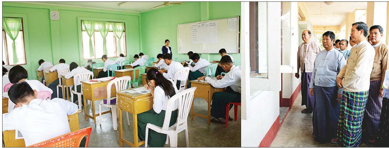
ပြည်ထောင်စုဝန်ကြီး ဒေါက်တာမျိုးသိမ်းကြီး ကျောင်းသား ကျောင်းသူများ မြန်မာစာဘာသာရပ်ဖြေဆိုနေမှု ကြည့်ရှုအားပေးစဉ်။ သတင်းစဉ်