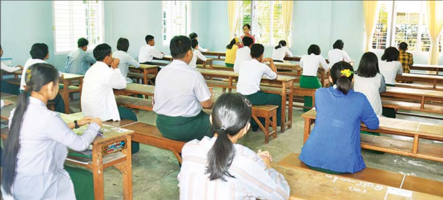
မန္တလေးတိုင်းဒေသကြီး အထက(၁၆) ချမ်းအေးသာစံ စာစစ်ဌာန၌ စာမေးပွဲဖြေဆိုနေသည့် ကျောင်းသား ကျောင်းသူများကို တွေ့ရစဉ်။ မင်းထက်အောင်(မန်းကိုယ်ပွား)