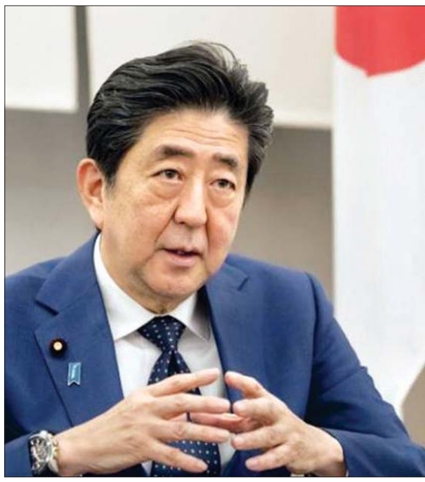
ဂျပန်ဝန်ကြီးချုပ် ရှင်ဒိုအာဘေး

တိုကျို မတ် ၁၁ ကိုရိုနာဗိုင်းရပ်စ် ကူးစက်ပြန့်ပွားမှု ကြောင့် ဖြစ်ပေါ်လာသည့်ဂယက် ရိုက်မှုများကို လျှော့ချရေးဆိုင်ရာ လုပ်ငန်းစဉ် ဒုတိယမြောက်စီမံချက် အား ဂျပန်အစိုးရက မကြာသေးမီက ထုတ်ပြန် ကြေညာလိုက်ကြောင်း သိရသည်။ ကူးစက်ပြန့်ပွားမှု တားဆီး ကာကွယ်ရေးလုပ်ငန်းအဖွဲ့ အစည်း အဝေးတွင် ဂျပန်အစိုးရက အမေ ရိကန်ဒေါ်လာ လေးဘီလီယံကျော် တန်ဖိုးရှိသည့် အစီအစဉ်များကို အတည်ပြုခဲ့ကြောင်း သိရသည်။ အဆိုပါ အစီအစဉ်များတွင် ကျောင်းများပိတ်လိုက်သည့်အတွက် အလုပ်မှ ခွင့်ယူရန် အကြောင်းဖန် လာသည့် မိဘများအတွက် ထောက်ပံ့ရေးများလည်းပါဝင်သည်။ ၎င်းတို့အား ဝင်ငွေဆိုင်ရာ အကူအညီ ပေးနိုင်ရေးအတွက် ထောက်ပံ့ကြေး အစီအစဉ်တစ်ခုကိုလည်း အကောင်