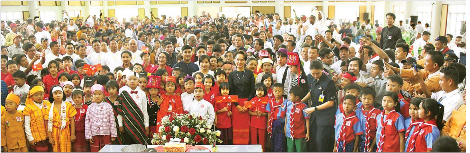
နိုင်ငံတော်၏အတိုင်ပင်ခံပုဂ္ဂိုလ် ဒေါ်အောင်ဆန်းစုကြည် ရွှေဘိုမြို့ရှိ ဒေသခံတိုင်းရင်းသား တိုင်းရင်းသူလေးများနှင့် စုပေါင်းမှတ်တမ်းတင်ဓာတ်ပုံရိုက်စဉ်။