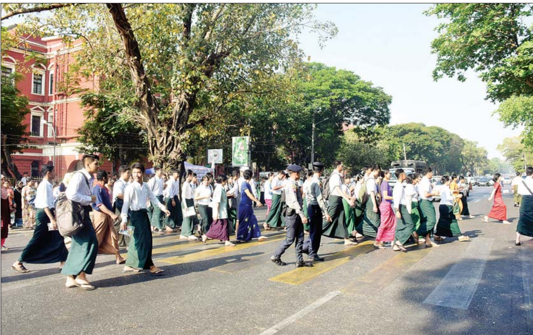
ရန်ကုန်တိုင်းဒေသကြီး အထက(၂) လသာ၌ စာမေးပွဲဖြေဆိုသည့် ကျောင်းသား ကျောင်းသူများကို တွေ့ရစဉ်။ ဇော်မင်းလတ်