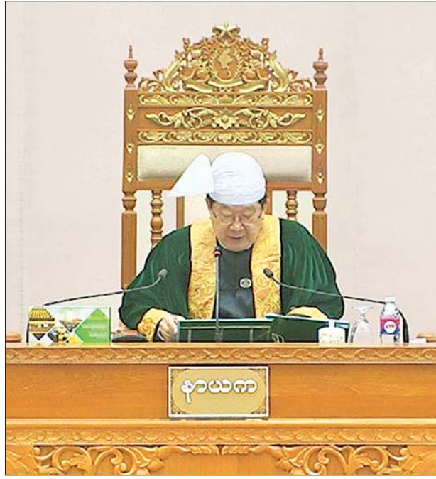
ပြည်ထောင်စုလွှတ်တော်နာယက ဦးတိခွန်မြတ်

ယင်းနောက် ပြည်ထောင်စုလွှတ်တော်နာယက က ညွှန်ကြားရေးမှူးချုပ် ယူ ဆောင်လာသည့် ဆန္ဒမဲလက်မှတ် အရေအတွက် ၆၇၀ ဖြစ်ပါကြောင်း၊ ယနေ့တက်ရောက်သည့် ကိုယ်စားလှယ် ၆၃၅ ဦးဖြစ်သည့်အတွက် အပိုဆန္ဒမဲ လက်မှတ် ၃၅ စောင်ကို မိမိထံတွင် ထားရှိမည် ဖြစ်ပါကြောင်း ပြောကြားသည်။