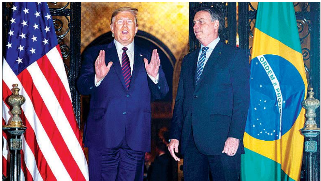
အမေရိကန်သမ္မတဒေါ်နယ်ထရမ်ကို ဘရာဇီးသမ္မတ ဂျာဘော်ဆိုနာရိုနဲ့အတူ တွေ့ရစဉ်။

ဗိုင်းရပ်စ် ပျံ့နှံ့ကူးစက်မှုဟာ ပေကျင်း၊ ရှန်ဟိုင်းနဲ့ ရှန်ကျန် တို့အပါအဝင် ဟူပေပြည်နယ် အပြင်ပိုင်းတွေ အထိ ဖြစ်လာခဲ့ပါတယ်။ အာရှနိုင်ငံတွေလည်း နိုဗယ်ကိုရိုနာဗိုင်းရပ်စ် စတင်ပျံ့နှံ့ ပြန့်ပွားရာ နေရာက လာရောက်တဲ့ လေကြောင်းလိုင်းတွေ ကို လေဆိပ်စစ်ဆေးမှုတွေ မဖြစ်မနေစတင်