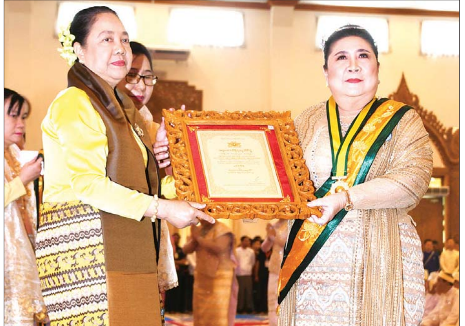
နိုင်ငံတော်သမ္မတ၏ဇနီး ဒေါ်ချိုချို အဂ္ဂမဟာသီရိသုဓမ္မသီရိ ဘွဲ့တံဆိပ်ရ ဒေါ်မိမိစိန်အား ဘွဲ့တံဆိပ်နှင့် အဆောင်အယောင်များ ပေးအပ်ချီးမြှင့်စဉ်။ သတင်းစဉ်

နိုင်ငံတော်ဖွဲ့စည်းပုံအခြေခံဥပဒေ ဆိုင်ရာခုံရုံးဥက္ကဋ္ဌ ဦးမျိုးညွန့် သုဓမ္မမဏိဇောတရေ ဘွဲ့တံဆိပ်ရ ဦးဟန်ဇော်ထွန်းအား ဘွဲ့တံဆိပ် နှင့် အဆောင်အယောင်များ ပေးအပ်ချီးမြှင့်စဉ်။ သတင်းစဉ်