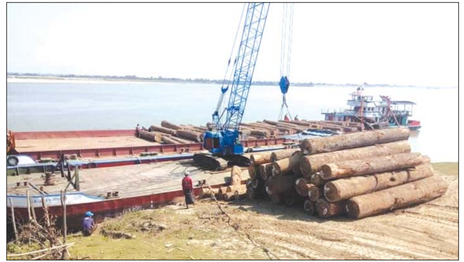
ခုတ်လှဲထုတ်ယူထားသည့် သစ်များကို ဧရာဝတီမြစ်ကြောင်းမှတစ်ဆင့် သယ်ယူရန် ပြင်ဆင်နေစဉ်။