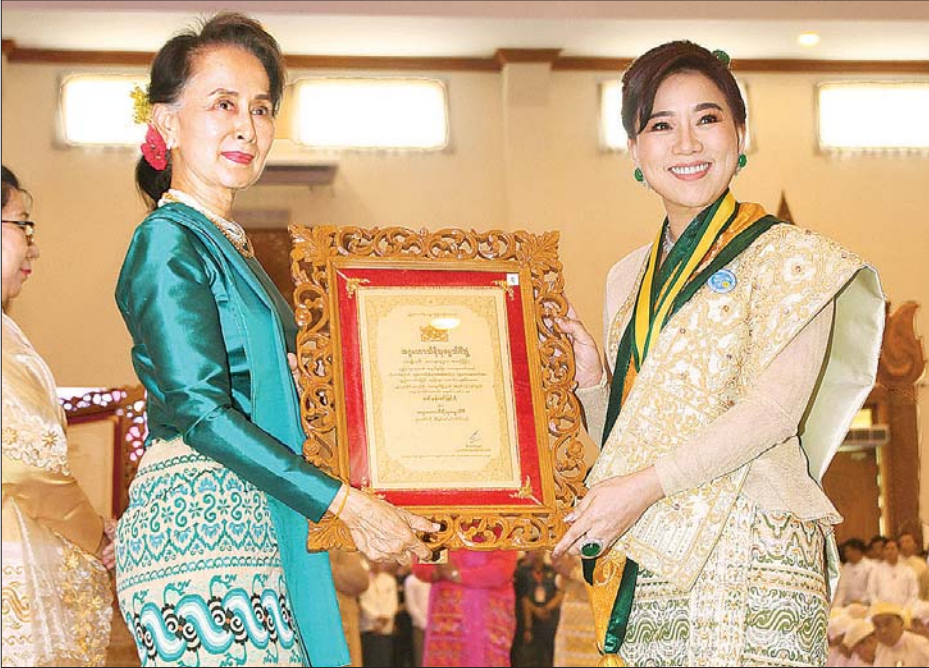
နိုင်ငံတော်၏အတိုင်ပင်ခံပုဂ္ဂိုလ် ဒေါ်အောင်ဆန်းစုကြည် အဂ္ဂမဟာသီရိသုဓမ္မသီရိ ဘွဲ့တံဆိပ်ရ ဒေါ်နန်းခင်မြင့်ရီအား ဘွဲ့တံဆိပ်နှင့် အဆောင်အယောင်များ ပေးအပ်ချီးမြှင့်စဉ်။ သတင်းစဉ်