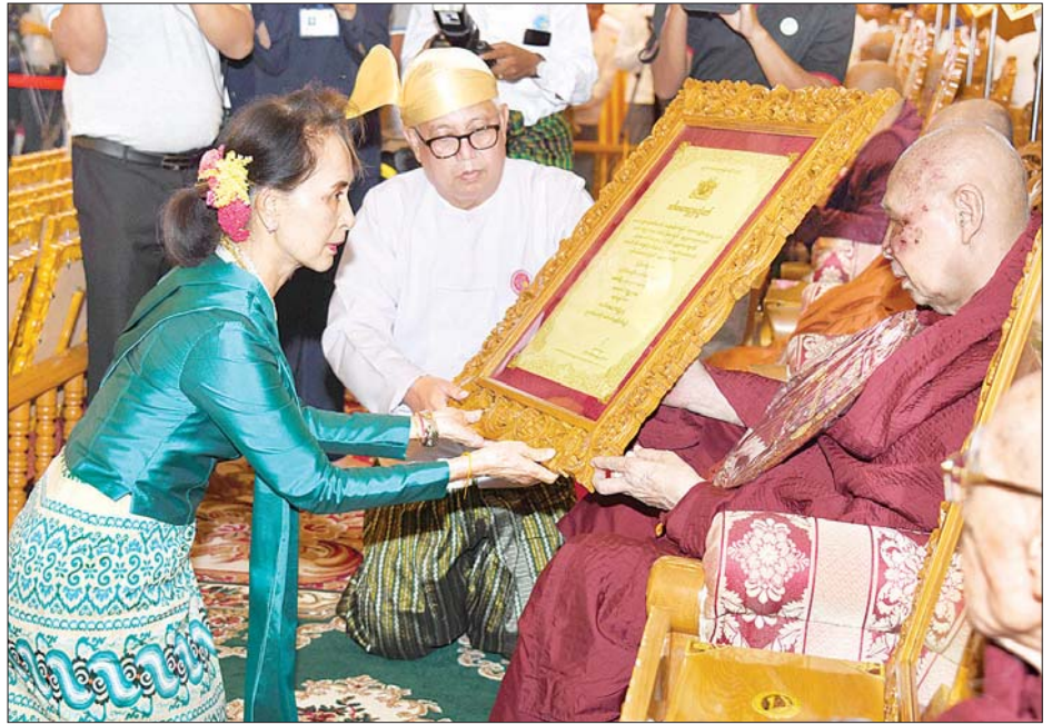
နိုင်ငံတော်၏အတိုင်ပင်ခံပုဂ္ဂိုလ် ဒေါ်အောင်ဆန်းစုကြည် အဘိဓမ္မေဟာရဋ္ဌာရု ဘွဲ့တံဆိပ်တော်ရ ပဲခူးတိုင်းဒေသကြီး ညောင်လေးပင်မြို့နယ် မဒေါက်မြို့ ပန်းငွေရုံတောရ စာသင်တိုက် ဆရာတော် ဘဒ္ဒန္တသုမနထံ ဘွဲ့တံဆိပ်တော် နှင့် အဆောင်အယောင်များ ဆက်ကပ်ပူဇော်စဉ်။ သတင်းစဉ်