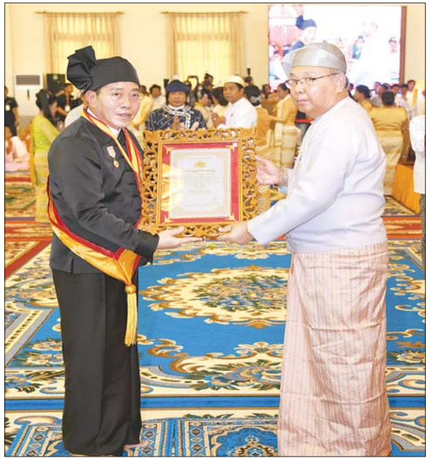
အမျိုးသားလွှတ်တော်ဥက္ကဋ္ဌ မန်းဝင်းခိုင်သန်း သီဟသူဓမ္မမဏိဇောတဓရ ဘွဲ့တံဆိပ်ရ ဦးကျော်မြင့်အား ဘွဲ့တံဆိပ်နှင့် အဆောင်အယောင်များ ပေးအပ်ချီးမြှင့်စဉ်။ သတင်းစဉ်