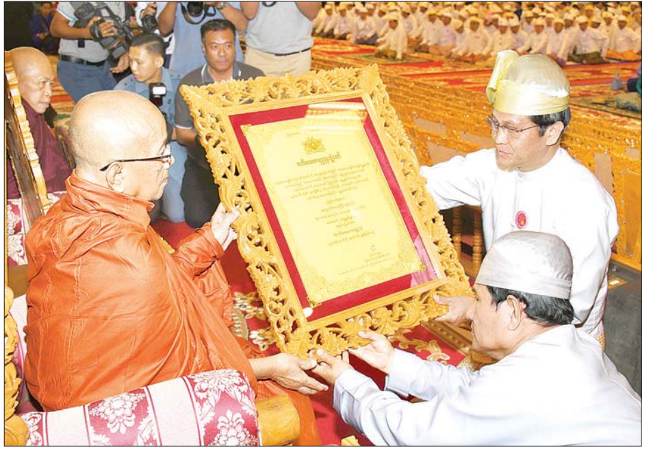
ဒုတိယသမ္မတ ဦးဟင်နရီဗန်ထီးယူ အဘိဓဇမဟာရဋ္ဌဂုရု ဘွဲ့တံဆိပ်တော်ရ မကွေးတိုင်းဒေသကြီး မကွေးမြို့ သံဃာရာမကျောင်းတိုက် ဆရာတော် ဘဒ္ဒန္တ စိန္တာသာရထံ ဘွဲ့တံဆိပ်တော်နှင့် အဆောင်အယောင်များ ဆက်ကပ် ပူဇော်စဉ်။ သတင်းစဉ်