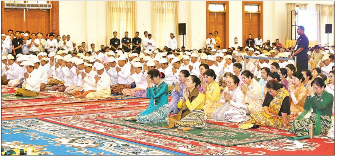
နိုင်ငံတော်သံဃမဟာနာယကအဖွဲ့အကျိုးတော်ဆောင် သန့်လှိုင်မြို့ မင်းကျောင်း ပထမပြန်စာသင်တိုက် ပဓာနနာယက အဂ္ဂမဟာပဏ္ဍိတ ဘဒ္ဒန္တစန္ဒိမာဘိဝံသထံမှ နိုင်ငံတော်သမ္မတ ဦးဝင်းမြင့်နှင့်ဇနီး ဒေါ်ချိုချို၊ နိုင်ငံတော်၏အတိုင်ပင်ခံ ပုဂ္ဂိုလ် ဒေါ်အောင်ဆန်းစုကြည်နှင့် ဧည့်ပရိသတ်များက ငါးပါးသီလခံယူဆောင်တည်ကြစဉ်။ သတင်းစဉ်