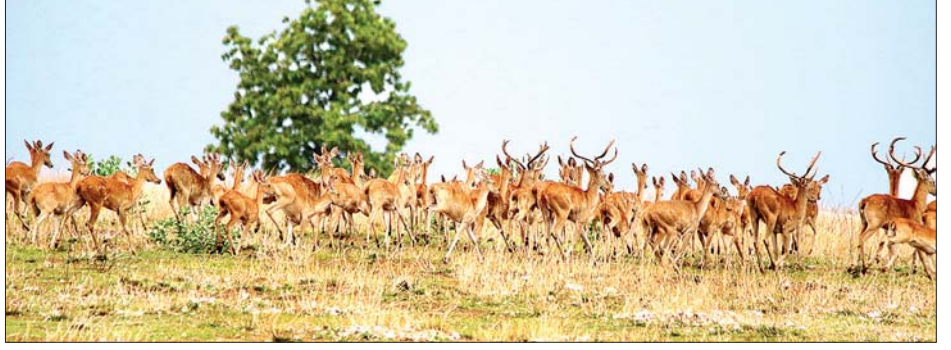
ရွှေစက်တော် ဘေးမဲ့တော၌ မွေးမြူထားသည့် ရွှေသမင်များ။