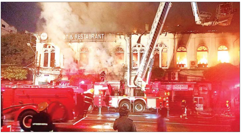
စားသောက်ဆိုင် မီးလောင်မှုအား မီးသတ်တပ်ဖွဲ့ဝင်များက ဝိုင်းဝန်းငြိမ်းသတ်ကြစဉ်။