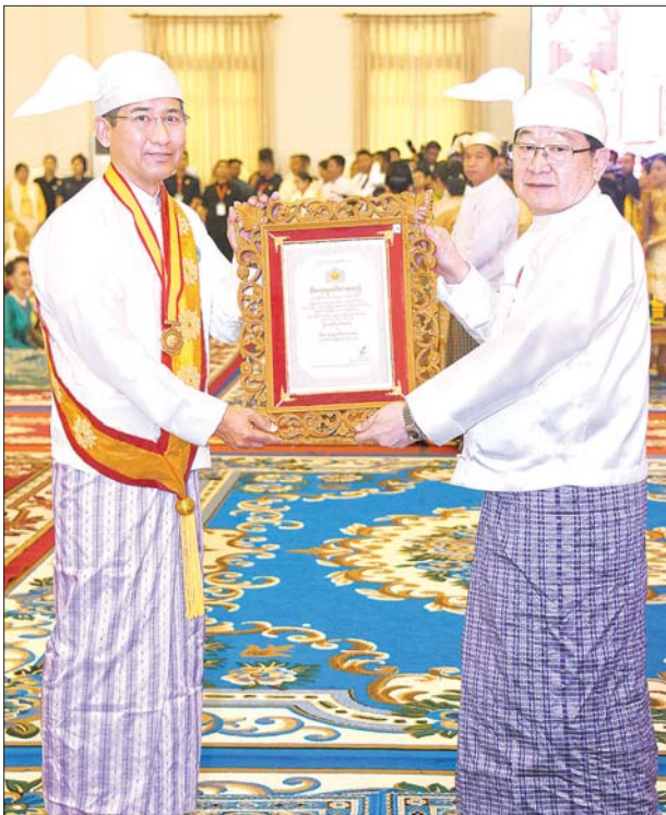
ပြည်သူ့လွှတ်တော်ဥက္ကဋ္ဌ ဦးတီခွန်မြတ် သီဟသူဓမ္မမဏိဇောတဓရ ဘွဲ့တံဆိပ်ရ ဦးအောင်မောင်အား ဘွဲ့တံဆိပ်နှင့် အဆောင်အယောင်များ ပေးအပ်ချီးမြှင့်စဉ်။ သတင်းစဉ်