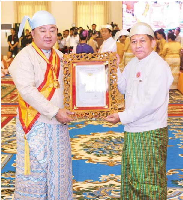
တပ်မတော်ကာကွယ်ရေးဦးစီးချုပ် ဗိုလ်ချုပ်မှူးကြီး မင်းအောင်လှိုင် သုဓမ္မမဏိဇောတဓရ ဘွဲ့တံဆိပ်ရ ဦးထွန်းထွန်းလင်းအား ဘွဲ့တံဆိပ်နှင့် အဆောင်အယောင်များ ပေးအပ်ချီးမြှင့်စဉ်။ သတင်းစဉ်