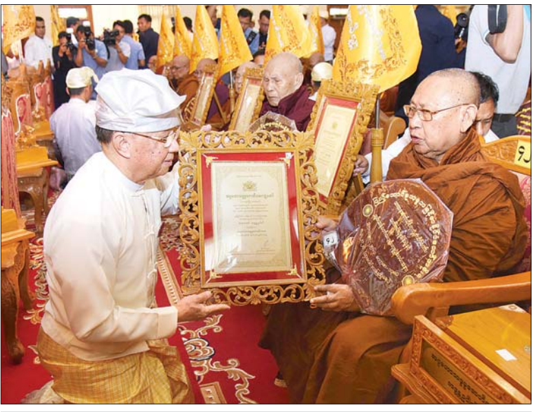
ပြည်သူ့လွှတ်တော် ဒုတိယဥက္ကဋ္ဌ ဦးထွန်းထွန်းဟိန် အဂ္ဂမဟာသဒ္ဓမ္မဇောတိကစေ ဘွဲ့တံဆိပ်တော်ရ မွန်ပြည်နယ် မုဒုံမြို့နယ် ကော့ခုံစံပြကျေးရွာ သာသနဓပေပုလ္လာရာမ ကျောင်းတိုက် ဆရာတော်ဘဒ္ဒန္တပုလိထံ ဘွဲ့တံဆိပ်တော်နှင့်အဆောင်အယောင်များ ဆက်ကပ် ပူဇော်စဉ်။ သတင်းစဉ်