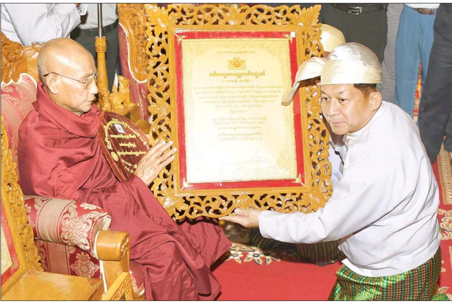
တပ်မတော်ကာကွယ်ရေးဦးစီးချုပ် ဗိုလ်ချုပ်မှူးကြီး မင်းအောင်လှိုင် အဘိဓဇအဂ္ဂမဟာ သဒ္ဓမ္မဇောတိက ဘွဲ့တံဆိပ် တော်ရ မန္တလေးတိုင်းဒေသကြီး ညောင်ဦးမြို့ ရွှေမင်းဝန်ကျောင်းတိုက် ဆရာတော် ဘဒ္ဒန္တဝိမလထံ ဘွဲ့တံဆိပ်တော် နှင့် အဆောင်အယောင်များ ဆက်ကပ်ပူဇော်စဉ်။ သတင်းစဉ်