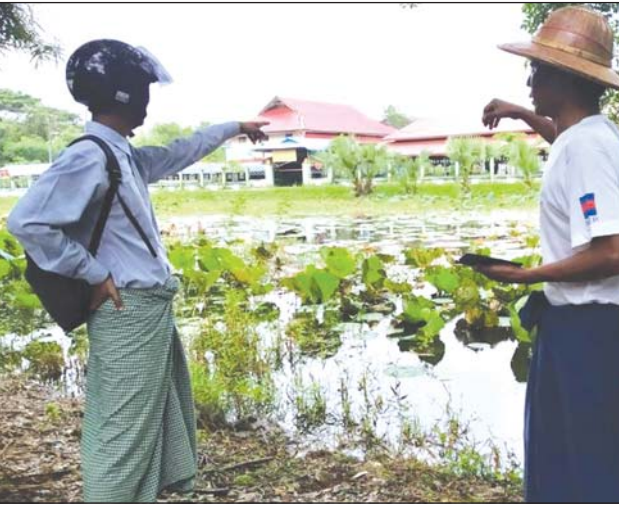
ကျေးရွာ ရေအရင်းအမြစ်စစ်တမ်း ကွင်းဆင်းကောက်ယူနေသည့် ဝန်ထမ်းတစ်ဦး