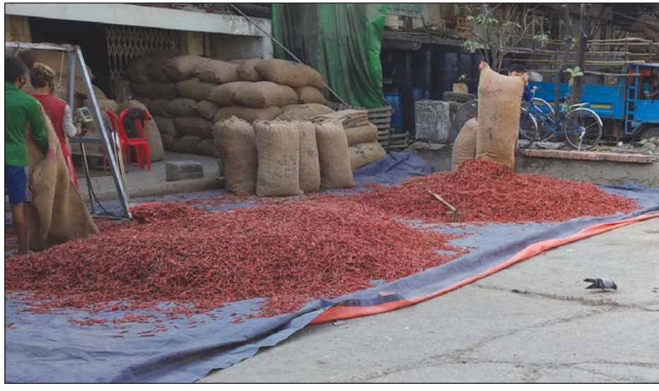
ရန်ကုန်မြို့ ဘုရင့်နောင်မှ ငရုတ်သီးပုံရိတ်တစ်ရုံ။

ယခုနှစ် ဇန်နဝါရီလလယ်ခန့်က ဟင်္သာတနယ်ထွက် အိန္ဒိယမျိုး ငရုတ်ရှည်အသစ်များ ရန်ကုန်ဈေးကွက်သို့ ဝင်ရောက်ခဲ့စဉ်က လက်ကားတစ်ပိဿာလျှင် ငွေကျပ် ၆၀၀၀ နှုန်းအထိရှိခဲ့ရာမှ ဈေးများကျလာခြင်းဖြစ်သည်။ လက်ရှိရန်ကုန် ငရုတ်ဈေးကွက်၌ ကြိုတင်ခန့်မှန်းချက်များ အရ ယခုနှစ် မြစ်ဝကျွန်းပေါ် ငရုတ်ရှည်အသစ်မျိုးစုံ