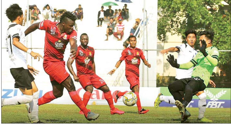
ဟံသာဝတီအသင်းနှင့် အား/ကာသိပွဲအသင်း ယှဉ်ပြိုင်နေစဉ်။

ကစားသမားအချို့မှလွဲ၍ နိုင်ငံခြားသားကစားသမား သုံးဦးအပါအဝင် လူစုံအသုံးပြုခဲ့သည်။ တန်းတက်အား/ကာသိပွဲ အသင်းမှလည်း ခဲ့သည်။ ဟံသာဝတီအသင်းသည် အမှတ်လိုနေသောကြောင့် အမာခံနိုင်ပွဲပြန်ရရန် ပွဲစကတည်းက စာမျက်နှာ ၁၂ ကော်လံ ၁ ❖