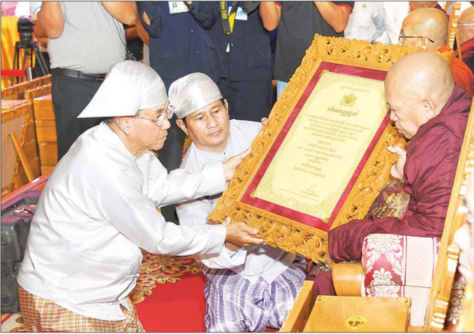
ဒုတိယသမ္မတ ဦးမြင့်ဆွေ အဘိဓဇမဟာရဋ္ဌဂုရု ဘွဲ့တံဆိပ်တော်ရ ရန်ကင်းမြို့နယ် ကျောက်ကုန်း တောရမေဒိနီ စာသင်တိုက် ဆရာတော် ဘဒ္ဒန္တ ကောဝိဒဓဇထံ ဘွဲ့တံဆိပ်တော်နှင့် အဆောင်အယောင်များ ဆက်ကပ် ပူဇော်စဉ်။ သတင်းစဉ်