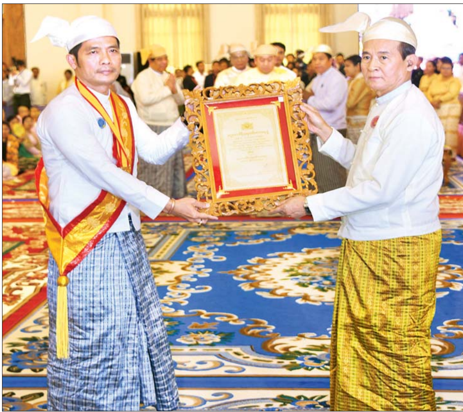
နိုင်ငံတော်သမ္မတ ဦးဝင်းမြင့် အဂ္ဂမဟာသီရိသုဓမ္မမဏိဇောတဓရ ဘွဲ့တံဆိပ်ရ ဦးဝိတ်အား ဘွဲ့တံဆိပ်နှင့် အဆောင်အယောင်များ ပေးအပ်ချီးမြှင့်စဉ်။ သတင်းစဉ်

ဘွဲ့တံဆိပ်များ ချီးမြှင့် ယနေ့ကျင်းပသည့် ၂၀၂၀ ပြည့် နှစ် သာသနာတော်ဆိုင်ရာ ဘွဲ့တံဆိပ် တော် ဆက်ကပ်ပူဇော်ပွဲ အခမ်း အနားတွင် ဆရာတော် ၃၂၂ ပါး၊ သီလရှင်ဆရာကြီး ၂၄ ပါးတို့အား သာသနာတော်ဆိုင်ရာ ဘွဲ့တံဆိပ် များကို ဆက်ကပ်ခဲ့ပြီး လူပုဂ္ဂိုလ် အမျိုးသား ၅၀ နှင့် အမျိုးသမီး ၉၁ ဦးတို့အား သာသနာတော်ဆိုင်ရာ ဘွဲ့တံဆိပ်များ ချီးမြှင့်အပ်နှင်းခဲ့ ကြောင်း သိရသည်။ သတင်းစဉ်