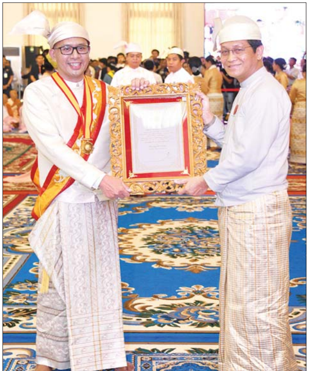
ဒုတိယသမ္မတ ဦးဟန်နရီဗန်ထီးယူ သီရိသုဓမ္မမဏိဇောတဓရ ဘွဲ့တံဆိပ်ရ ဦးကျော်စွာဝင်း(ခ) ဦးမြကျော်စွာဝင်းအား ဘွဲ့တံဆိပ်နှင့် အဆောင်အယောင် များ ပေးအပ်ချီးမြှင့်စဉ်။ သတင်းစဉ်