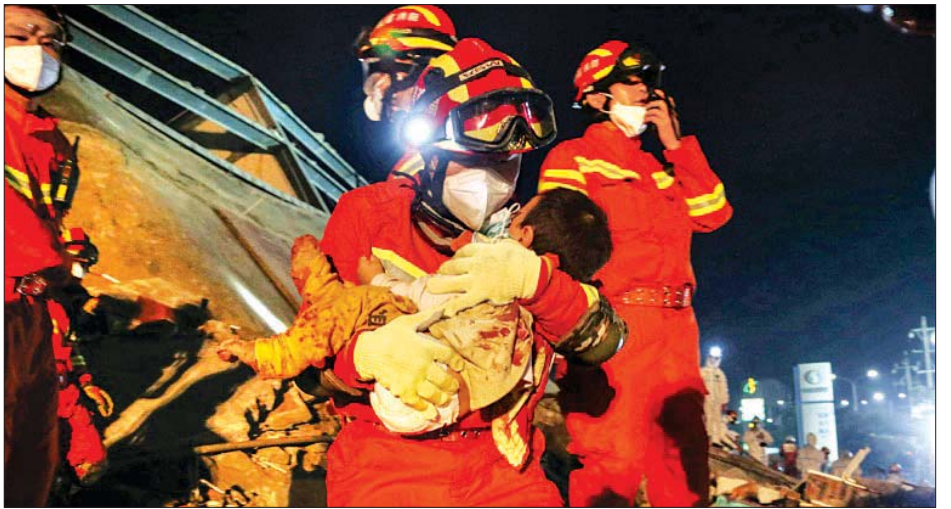
ကယ်ဆယ်ရေးအဖွဲ့ဝင်များက ပြိုကျအဆောက်အအုံထဲမှ ကလေးငယ်တစ်ဦးကို ကယ်ထုတ်လာစဉ်။

သတင်းစာက ဖော်ပြသည်။ မီးသတ်ဌာနက ဖော်ပြခဲ့သည့် ရုပ်သံဖိုင်ထဲ၌ ကယ်ဆယ်ရေးအဖွဲ့ဝင်များက ခြောက်ထပ်အဆောက်အအုံဖြစ်သည့် စီကျားဟိုတယ်၏ အပျက်အစီးပုံထဲမှ ဆွဲထုတ်လာသည့်ကလေးငယ်များကို နှာခေါင်းစည်းများ ဝတ်ဆင်ပေးလျက်ရှိသည်ကို တွေ့မြင်ရသည်။ ကယ်ဆယ်ရေးအဖွဲ့သားများသည် ဗိုင်းရပ်စ်ကူးစက်ပျံ့နှံ့ခြင်းမှ ကာကွယ်သည့်အနေဖြင့် တစ်ဦးနှင့်တစ်ဦး ဆေးဖျန်းနေကြသည်ကိုလည်း ရုပ်သံဖိုင်ထဲတွင် တွေ့ရသည်။ အခင်းဖြစ်ပွားရာလမ်းပေါ်တွင် တပ်ဆင်ထားသည့် လုံခြုံရေးကင်မရာများထဲတွင် စက္ကန့်ပိုင်းအတွင်းဟိုတယ်အဆောက်အအုံ လဲပြိုကျခဲ့သည့်မြင်ကွင်းကို ဒေသမီဒီယာက ဖော်ပြခဲ့သည်။ ဟိုတယ်ပြိုကျမှု ဖြစ်ပွားချိန်တွင် လူကုံးဦးမှာဘေးကင်းစွာ ထွက်ပြေးလွတ်မြောက်လာခဲ့ကြောင်း အရေးပေါ်စီမံခန့်ခွဲမှုဝန်ကြီးဌာနက ဖော်ပြခဲ့သည်။ အေအက်ဖ်ပီ