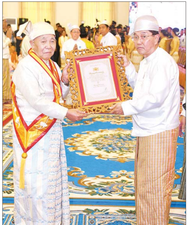
ဒုတိယသမ္မတ ဦးမြင့်ဆွေ သီရိသုဓမ္မမဏိဇောတဓရ ဘွဲ့တံဆိပ်ရ ဦးမိုးအား ဘွဲ့တံဆိပ်နှင့် အဆောင်အယောင်များ ပေးအပ်ချီးမြှင့်စဉ်။ သတင်းစဉ်