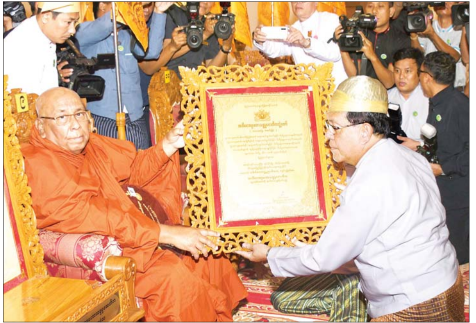
ပြည်ထောင်စုတရားသူကြီးချုပ် ဦးထွန်းထွန်းဦး အဘိဓဇအဂ္ဂမဟာ သဒ္ဓမ္မဇောတိက ဘွဲ့တံဆိပ်တော်ရ စစ်ကိုင်းတိုင်း ဒေသကြီး စစ်ကိုင်းမြို့ သီတဂူ ဗုဒ္ဓတက္ကသိုလ် အဓိပတိဆရာတော် ဒေါက်တာဘဒ္ဒန္တ ဉာဏိဿရထံ ဘွဲ့တံဆိပ်တော် နှင့် အဆောင်အယောင်များ ဆက်ကပ်ပူဇော်စဉ်။ သတင်းစဉ်