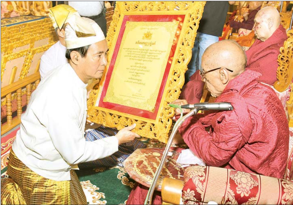
နိုင်ငံတော်သမ္မတ ဦးဝင်းမြင့် အဘိဓမ္မေဟာရဋ္ဌာရု ဘွဲ့တံဆိပ်တော်ရ မန္တလေးတိုင်းဒေသကြီး မြင်းခြံမြို့ ချောင်းဒေါင်း စာသင်တိုက် ဆရာတော် ဘဒ္ဒန္တ ကေလာသထံ ဘွဲ့တံဆိပ်တော်နှင့် အဆောင်အယောင်များ ဆက်ကပ်ပူဇော်စဉ်။ သတင်းစဉ်

၁၃၈၁ ခုနှစ်၊ တပေါင်းလပြည့်ကျော် ၁ ရက် ၂၀၂၀ ပြည့်နှစ်၊ မတ် ၉ ရက်၊ တနင်္လာနေ့ အတွဲ (၅၉)၊ အမှတ် (၁၆၁)