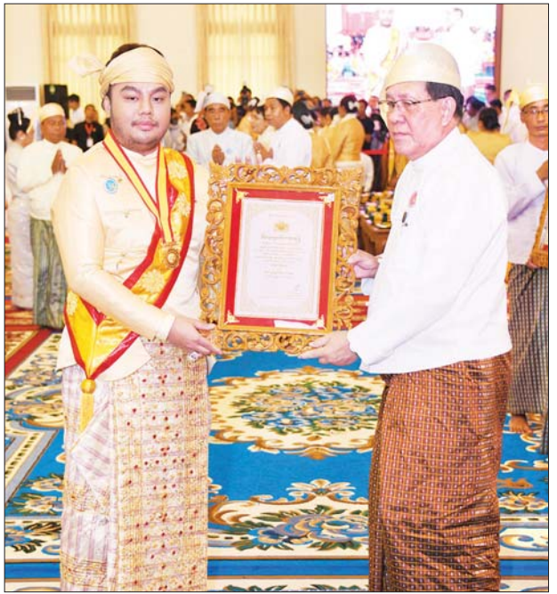
ပြည်ထောင်စုတရားသူကြီးချုပ် ဦးထွန်းထွန်းဦး သီဟသူဓမ္မမဏိဇောတဓရ ဘွဲ့တံဆိပ်ရ ဦးချမ်းမြေ့ဆွေအား ဘွဲ့တံဆိပ်နှင့် အဆောင်အယောင်များ ပေးအပ်ချီးမြှင့်စဉ်။ သတင်းစဉ်