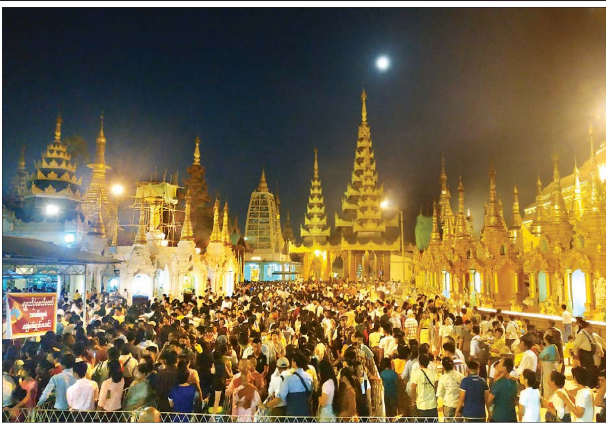
တပေါင်းလပြည်နေ့ ညပိုင်းက ရွှေတိဂုံစေတီတော်ရင်ပြင်တွင် ဘုရားဖူးပြည်သူများ၊ ကုသိုလ်ကောင်းမှုပြုကြသူများဖြင့် စည်ကားစွာတွေ့ရစဉ်။

တပေါင်းလပြည်နေ့ နေပြည်တော်၊ ရန်ကုန်နှင့် မန္တလေးမြို့တို့ရှိ ဘုရားပုထိုးစေတီများ၌ ဘုရားဖူးလာပြည်သူများ၊ ကုသိုလ်ပြုကြသူများဖြင့် စည်ကားများပြား