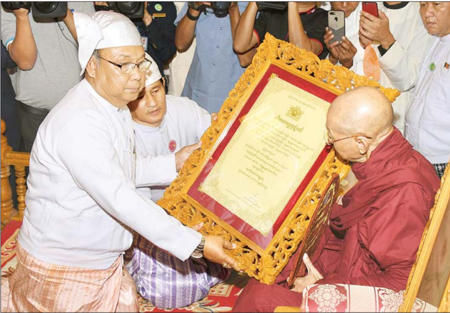
အမျိုးသားလွှတ်တော်ဥက္ကဋ္ဌ မန်းဝင်းခိုင်သန်း အဘိဓဇမဟာရဋ္ဌဂုရု ဘွဲ့တံဆိပ်တော်ရ ပါမောက္ခချုပ် ဆရာတော် ဒေါက်တာ ဘဒ္ဒန္တနန္ဒမာလာဘိဝံသထံ ဘွဲ့တံဆိပ်တော်နှင့် အဆောင်အယောင်များ ဆက်ကပ်ပူဇော်စဉ်။