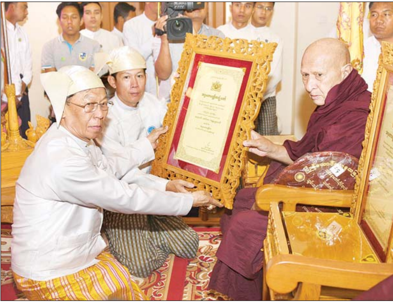
ပြည်ထောင်စုရွေးကောက်ပွဲကော်မရှင်ဥက္ကဋ္ဌ ဦးလှသိန်း အဂ္ဂမဟာပဏ္ဍိတ ဘွဲ့တံဆိပ်တော်ရ ရခိုင်ပြည်နယ် မြောက်ဦးမြို့ အောင်မင်္ဂလာကျောင်းတိုက်ဆရာတော် ဒေါက်တာဘဒ္ဒန္တ ပညာဝံသထံ ဘွဲ့တံဆိပ်တော်နှင့် အဆောင်အယောင်များ ဆက်ကပ်ပူဇော်စဉ်။ သတင်းစဉ်

ဆက်လက်၍ ပြည်ထောင်စု ဝန်ကြီးများ၊ ပြည်ထောင်စုရှေ့နေချုပ်၊ ပြည်ထောင်စု စာရင်းစစ်ချုပ်၊ ပြည်ထောင်စုရတနာဝန်အဖွဲ့ ဥက္ကဋ္ဌ၊ နေပြည်တော်ကောင်စီဥက္ကဋ္ဌ၊ မြန်မာ နိုင်ငံတော်ဗဟိုဘဏ်ဥက္ကဋ္ဌ၊ ညှိနှိုင်း ကွပ်ကဲရေးမှူး (ကြည်း၊ ရေ၊ လေ)၊ နေပြည်တော်တိုင်းစစ်ဌာနချုပ်တိုင်း မှူး၊ ဒုတိယဝန်ကြီးများ၊ နေပြည်တော် ကောင်စီဝင်များ၊ အမြဲတမ်းအတွင်းဝန် များနှင့် ညွှန်ကြားရေးမှူးချုပ်များက အဂ္ဂမဟာ ပဏ္ဍိတ၊ အဂ္ဂမဟာသဒ္ဓမ္မ ဇောတိကစေ၊ အဂ္ဂမဟာ ကမ္မဋ္ဌာနာ စရိယ၊ အဂ္ဂမဟာဂန္ထဝါစက ပဏ္ဍိတ၊ မဟာဓမ္မကထိက ဗဟုဇနဟိတစရ၊ မဟာဂန္ထဝါစက ပဏ္ဍိတ၊ မဟာသဒ္ဓမ္မ ဇောတိကစေ၊ မဟာကမ္မဋ္ဌာနာ စရိယ၊ ဓမ္မကထိကဗဟုဇနဟိတစရ၊ ဂန္ထဝါ စကပဏ္ဍိတ၊ သဒ္ဓမ္မဇောတိကစေ၊ ကမ္မဋ္ဌာနာစရိယ ဘွဲ့တံဆိပ်တော်ရ ဆရာတော်များအား ဘွဲ့တံဆိပ်တော် နှင့် အဆောင်အယောင်များ ဆက်ကပ် ပူဇော်ကြသည်။ ထို့နောက် နိုင်ငံတော်သမ္မတ