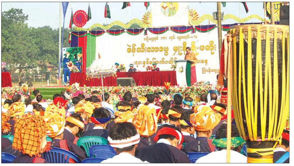
မွန်ပြည်နယ်ဝန်ကြီးချုပ် ဒေါက်တာအေးဇံ (၇၁) နှစ်မြောက် ပအိုဝ်းအမျိုးသားနေ့အခမ်းအနား၌ အမှာစကား ပြောကြားစဉ်။

ယင်းနောက် ပအိုဝ်းအမျိုးသားနေ့ ဖြစ်ပေါ်လာပုံကို ကျင်းပရေးကော်မတီဝင်တစ်ဦးက ရှင်းလင်းဖတ်ကြားပြီး ပအိုဝ်းအမျိုးသားခေါင်းဆောင် ဦးအောင်ခမ်းထိထံမှပေး