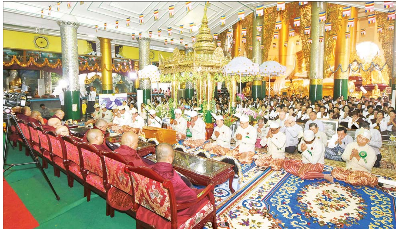
ရွှေတိဂုံစေတီတော်၏ ဗုဒ္ဓပူဇော်ပွဲ တပေါင်းပွဲတော်ကျင်းပစဉ်။

သတင်းစဉ်၊ ကိုကိုစော် တင်မောင်(မန်းကိုယ်ပွား)