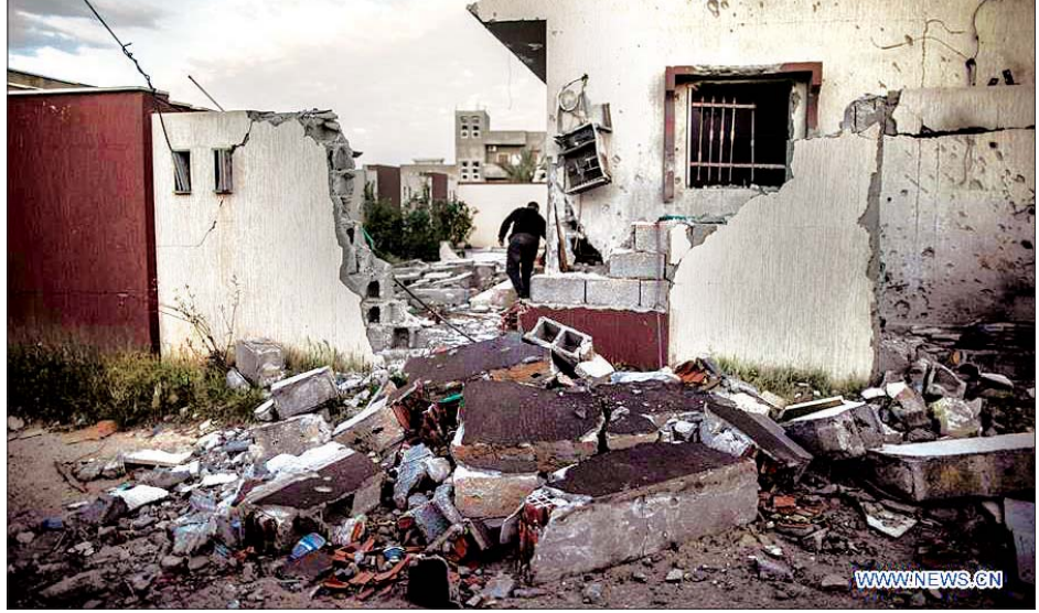
ထရီပိုလီတောင်ပိုင်းရှိ တိုက်ပွဲဖြစ်ပွားမှုကြောင့် ပျက်စီးနေသော အဆောက်အအုံများကို တွေ့ရစဉ်။

အရှေ့ဘက် အခြေစိုက်တပ်ဖွဲ့သည် ၂၀၁၉ ခုနှစ် ဧပြီလကတည်းက စတင်ကာ မြို့တော်ထရီပိုလီ အနီးတစ်ဝိုက်တွင် စစ်ဆင်ရေးဆင်နွှဲမှုများ လုပ်ဆောင်လာခဲ့ပြီး ကုလထောက်ခံသည့် အစိုးရကို ဖြုတ်ချနိုင်ရေး ကြိုးပမ်းခဲ့သည်။ ထိုစစ်ဆင်ရေးတိုက်ခိုက်မှုများအတွင်း သေဆုံးသူနှင့် ထိခိုက်ဒဏ်ရာရသူ ထောင်ပေါင်းများစွာရှိခဲ့ပြီး အရပ်သား ၁၅၀၀၀ ကျော် နေအိမ်စွန့်ခွာထွက်ပြေးခဲ့ရသည်။ ဆင်ပွာ