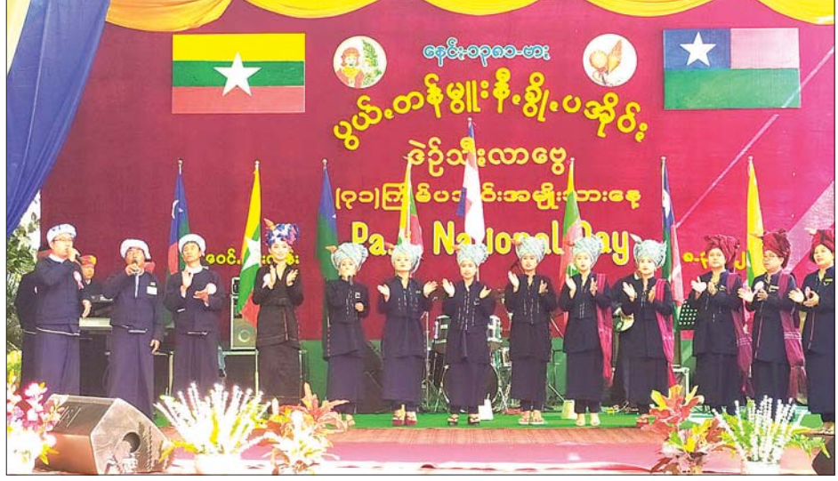
ရန်ကုန်မြို့၌ (၇၁) နှစ်မြောက် ပအိုဝ်းအမျိုးသားနေ့ အခမ်းအနားကျင်းပစဉ်။

သထုံရွှေစာရံစေတီတော်ကို တည်ထားခဲ့သော သူရိယစန္ဒာ မင်းမြတ်၏ မွေးနေ့(တပေါင်းလပြည့်)နေ့ကို ပအိုဝ်းအမျိုးသားနေ့အဖြစ်သတ်မှတ်ပြီး ကျင်းပလာသည်မှာ (၇၁)နှစ်မြောက် ရှိကာ မန္တလေးမြို့တွင် (၂၃)ကြိမ်မြောက် ကျင်းပခြင်းဖြစ်ကြောင်း ပအိုဝ်းတိုင်းရင်းသားစာပေနှင့် ယဉ်ကျေးမှုကော်မတီ နာယက ဦးခွန်သိန်းထွန်းက ပြောကြားသည်။ သန်းဇော်မင်း(ပြန်/ဆက်)