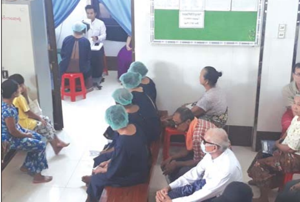
မျက်စိရောဂါ ကုသမှုခံယူရန် စောင့်ဆိုင်းနေသည့် ဝေဒနာရှင်များ