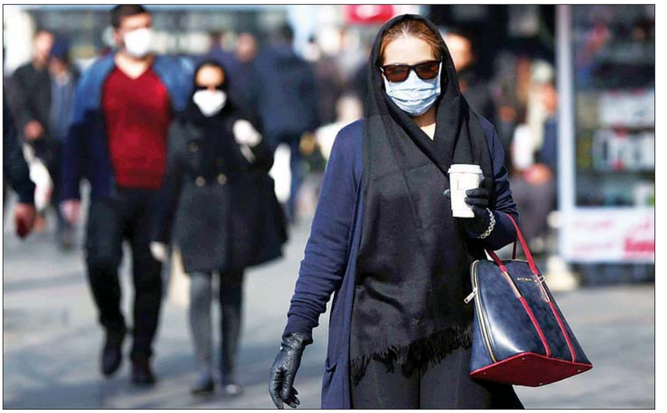
ကိုရိုနာဗိုင်းရပ်စ်ကူးစက်မှုမှ ကာကွယ်ရန် နှာခေါင်းစည်းများ တပ်ဆင်ထားကြသည့် အီရန်ပြည်သူများ။

တီဟီရန် မတ် ၄ အီရန်နိုင်ငံ၌ ရက်သတ္တနှစ်ပတ်အတွင်း ကိုရိုနာဗိုင်းရပ်စ် ကူးစက်မှုကြောင့် ၇၇ ဦးထက်မနည်း သေဆုံးခဲ့ပြီးနောက် တွင် အစိုးရက ဗိုင်းရပ်စ်တိုက်ပျက်ရေးဆောင်ရွက်ရန် ကြိုးပမ်းသည့်အနေဖြင့် လူထုထပ်ပြည့်ကျပ်နေသည့် အကျဉ်းထောင်များမှ အကျဉ်းသားများကို ယာယီလွှတ်ပေးလိုက်ကြောင်း သိရသည်။ အကျဉ်းသားများထံ၌ ကိုရိုနာဗိုင်းရပ်စ်ကူးစက်ခံထားရကြောင်း စစ်ဆေးတွေ့ရှိခဲ့ပြီးနောက်တွင် ၎င်းတို့ကို အကျဉ်းထောင်ပြင်ပသို့ ထုတ်ပေးရန် ခွင့်ပြုပေးလိုက်ကြောင်း တရားရေးဆိုင်ရာ ပြောရေးဆိုခွင့်ရှိသူ ဂိုလ်မဟီနီ အက်စ်မိုင်လီက သတင်းထောက်များသို့ ပြောကြားခဲ့သည်။ ထောင်ဒဏ်ငါးနှစ်အထက် ချမှတ်ထားခြင်းခံရသည့် လုံခြုံရေးအကျဉ်းသားများကို လွှတ်ပေးမည်မဟုတ်ကြောင်း သိရသည်။ အကျဉ်းချခံထားရသည့် ဗြိတိန်-အီရန် စေတနာ့ဝန်ထမ်း နာဇာနီယန် ဇာဂါရီရက်ကလီဖီကို မကြာမီ လွှတ်ပေးမည်ဖြစ်ကြောင်း ဗြိတိန်ပါလီမန် အမတ်တစ်ဦးက ပြောသည်။ နာဇာနီယန် ဇာဂါရီရက်ကလီဖီကို ပြီးခဲ့သည့် ၂၀၁၆ ခုနှစ်က သူ့လျှို့အဖြစ် ဆောင်ရွက်သည်ဟုဆိုကာ အရေးယူခဲ့ပြီးနောက် ၎င်းကို ထောင်ဒဏ်ငါးနှစ် ချမှတ်ခဲ့ကာ တီဟီရန်ရှိ အိမ်အကျဉ်းထောင်၌ ပြစ်ဒဏ်ကျခံစေခဲ့သည်။ အီရန်၌ ကိုရိုနာဗိုင်းရပ်စ်ကူးစက်ခံရသူအရေအတွက်