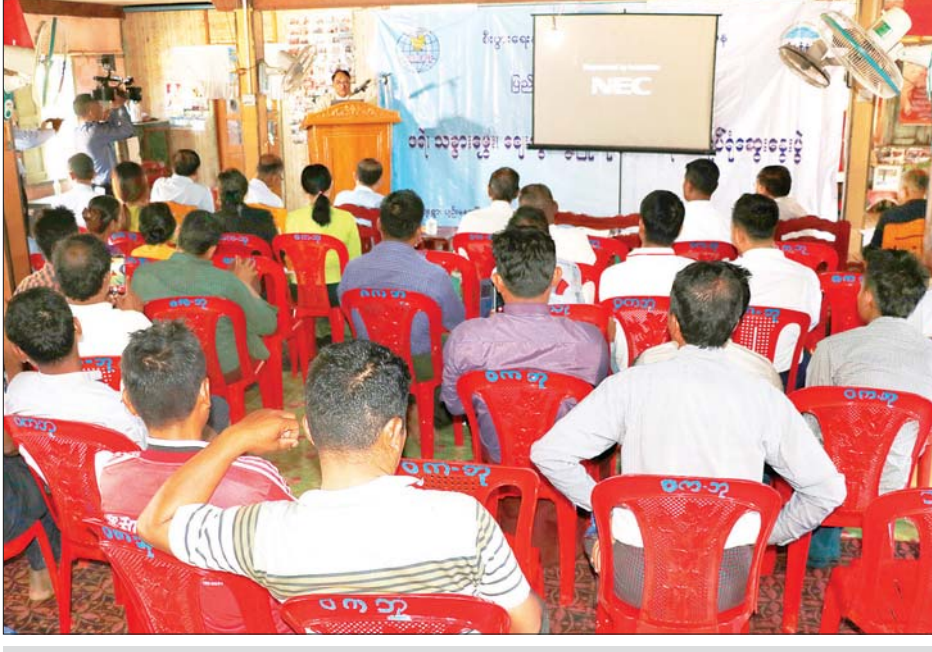
ပြည်ထောင်စုဝန်ကြီး ဒေါက်တာသန်းမြင့် ဖရဲ၊ သခွားမွှေး သီးနှံဈေးကွက် ဖွံ့ဖြိုးတိုးတက်ရေး အလုပ်ရုံဆွေးနွေးပွဲတွင် အမှာစကားပြောကြားစဉ်။ သတင်းစဉ်

နေပြည်တော် မတ် ၄ ဖရဲ၊ သခွားမွှေး သီးနှံဈေးကွက်ဖွံ့ဖြိုးတိုးတက်ရေး အလုပ်ရုံဆွေးနွေးပွဲကို ယနေ့မွန်းလွဲ ၁ နာရီတွင် ပျဉ်းမနားမြို့နယ် ကူးတို့ဆိပ်ကမ်းကျေးရွာအုပ်စု မီးရိုင်းကျေးရွာတွင် ကျင်းပသည်။ ရှေးဦးစွာ ပြည်ထောင်စုဝန်ကြီး ဒေါက်တာသန်းမြင့်က စီးပွားရေးနှင့် ကူးသန်းရောင်းဝယ်ရေး ဝန်ကြီးဌာန အနေဖြင့် စိုက်ပျိုးထုတ်လုပ်သူများ၊ ကုန်သည်လုပ်ငန်းရှင်များနှင့် စားသုံးသူ ပြည်သူများအကြား အချိတ်အဆက်မိအောင်ဆောင်ရွက်ပေးလျက် ရှိကြောင်း၊ ပြည်တွင်းမှထွက်ရှိသော ရာသီပေါ်သီးနှံများအား ပြည်ပသို့ တင်ပို့ရောင်းချလျက်ရှိရာ တင်ပို့သော သီးနှံများအား သန့်ရှင်းလတ်ဆတ်ပြီး ရောဂါပိုးမွှားကင်းစင်သည့် အရည်အသွေးမြင့်သီးနှံများနှင့် မျိုးကောင်းမျိုးသန့်သီးနှံများ စိုက်ပျိုးနိုင်ရေး အတွက် အထူးအလေးထားဆောင်ရွက်ကြရန်လိုကြောင်း၊ အခြားပြည်ပပို့ကုန်များဖြစ်သော ပဲစင်းပုံ၊ မတ်ပဲ၊ ပဲတီစိမ်း၊ ပြောင်းတို့အား လက်ရှိအချိန်တွင် ကုန်ကြမ်းအတိုင်းသာ တင်ပို့နေရသဖြင့် တန်ဖိုးမြင့်ထုတ်ကုန်အဖြစ် ပြုပြင်တင်ပို့နိုင်ရေးကိုလည်း အားပေးကူညီဆောင်ရွက်ပေးစေလိုပါကြောင်း၊ မိမိတို့ဝန်ကြီးဌာနအနေဖြင့် ကုန်ပစ္စည်း စိုက်ပျိုးထုတ်လုပ်သူများ၊ ဝယ်ယူရောင်းချသူများ၊ ပြည်တွင်း / ပြည်ပသို့ တင်ပို့ရောင်းချသူများ