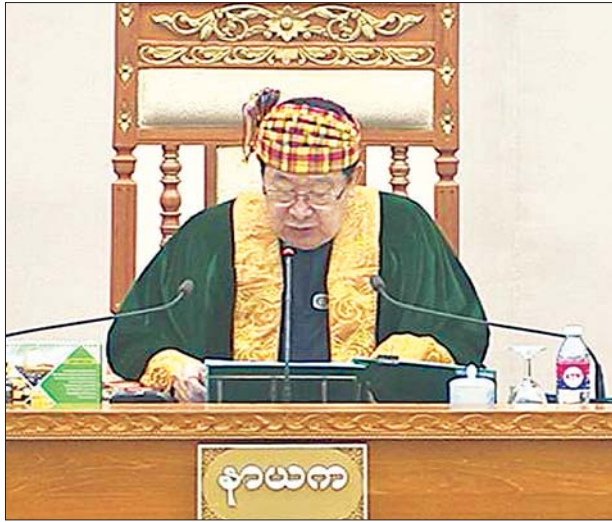
ပြည်ထောင်စုလွှတ်တော်နာယက ဦးတီခွန်မြတ်

တပ်မတော်သားပြည်သူ့လွှတ်တော်ကိုယ်စားလှယ် ဗိုလ်မှူးချုပ် ရဲနိုင်မျိုးက ကမ္ဘာပေါ်တွင် ငြိမ်းချမ်းစွာ ဖွဲ့စည်းပုံအခြေခံဥပဒေဆိုသည်မှာ မရှိနိုင်