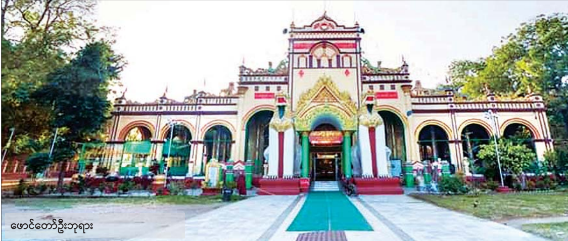
ဖောင်တော်ဦးဘုရား

ဒီနေရာတွေကတော့ လွယ်လွယ်ကူကူ ပခုက္ကူမြို့အနီးအပါးလည်ပတ်နိုင်မယ့်နေရာ တွေပါ။ နည်းနည်းခပ်လှမ်းလှမ်းကို သွားမယ် ဆိုရင် ဒီနေရာတွေကို လည်ပတ်သွားလာ နိုင်ပါသေးတယ်။ (ဆက်လက်ဖော်ပြပါမည်)