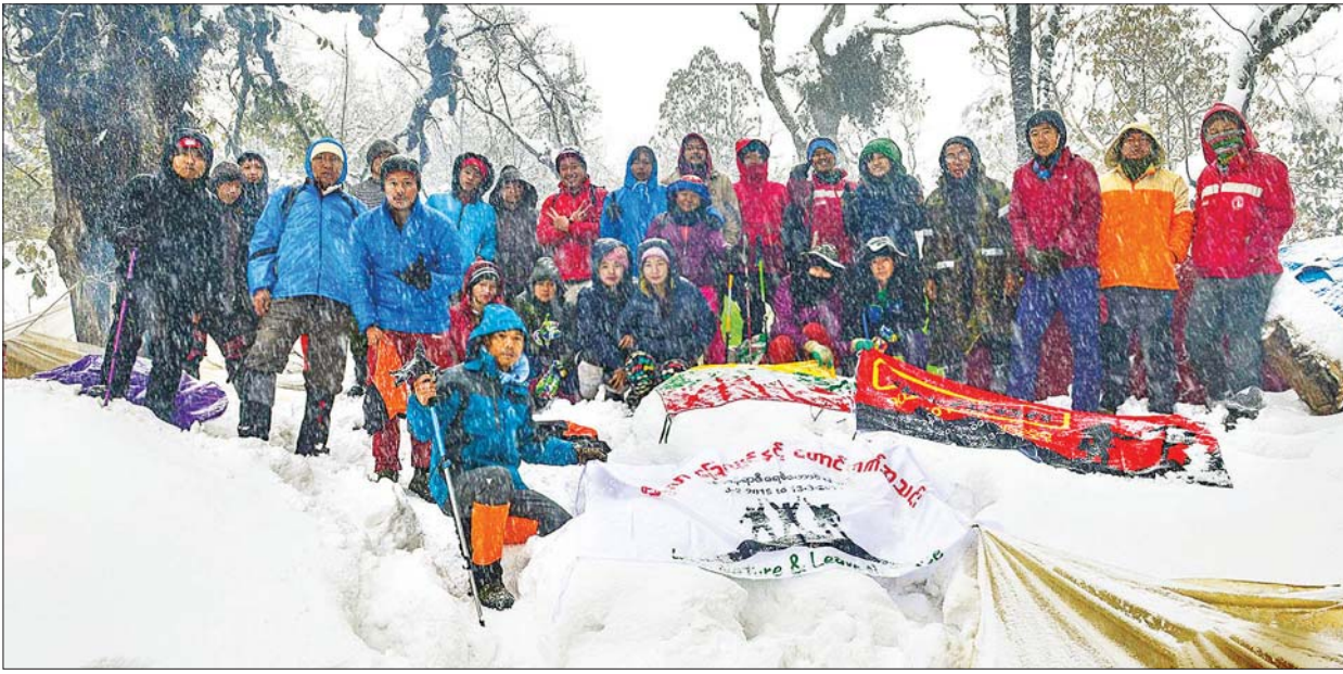
မိတ္ထီလာခြေလျင်နှင့်တောင်တက်အသင်း ဖုန်ကန်ရာဇီရေခဲတောင်ပေါ်သို့ ယမန်နှစ်က တက်ရောက်ခဲ့စဉ်။