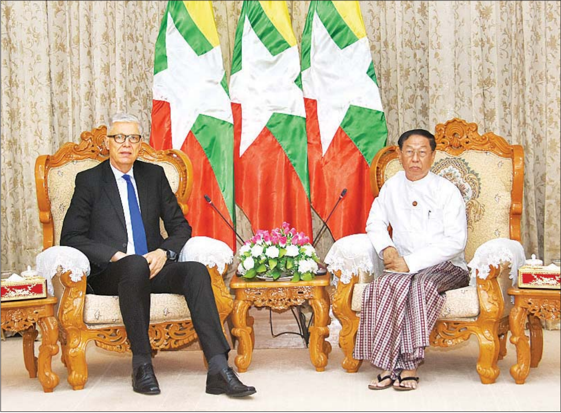
ပြည်ထောင်စုရွေးကော်မရှင်ဥက္ကဋ္ဌ ဦးလှသိန်း မြန်မာနိုင်ငံဆိုင်ရာ ဒိန်းမတ်နိုင်ငံ သံအမတ်ကြီး မစ္စတာ ဂျွန်နီလ်စင် အား လက်ခံတွေ့ဆုံစဉ်။ သတင်းစဉ်

ရွေးကောက်ပွဲဆိုင်ရာ စွမ်းရည်မြှင့်တင်ရေးများ ဆောင်ရွက်နေမှု၊ အရပ်ဘက်လူမှုအဖွဲ့အစည်းများနှင့် ပူးပေါင်း၍ ပြည်သူလူထုအသိပညာပေးလုပ်ငန်းများနှင့် မဲဆန္ဒရှင်အသိပညာပေးလုပ်ငန်းများ ဆောင်ရွက်နေမှု၊ နိုင်ငံရေးပါတီများနှင့် လွှတ်တော်ကိုယ်စားလှယ်လောင်းများအတွက် ကျင့်ဝတ် (Code of Conduct) ပြန်လည်ပြင်ဆင်မှုအခြေအနေများ၊ Social Media ပေါ်မှ အမုန်းစကားများ၊ သတင်းအမှားများကို ကာကွယ်တားဆီးသွားမည့် အစီအစဉ်များနှင့်စပ်လျဉ်း၍ ရင်းနှီးပွင့်လင်းစွာ ဆွေးနွေးခဲ့ကြသည်။ သတင်းစဉ်