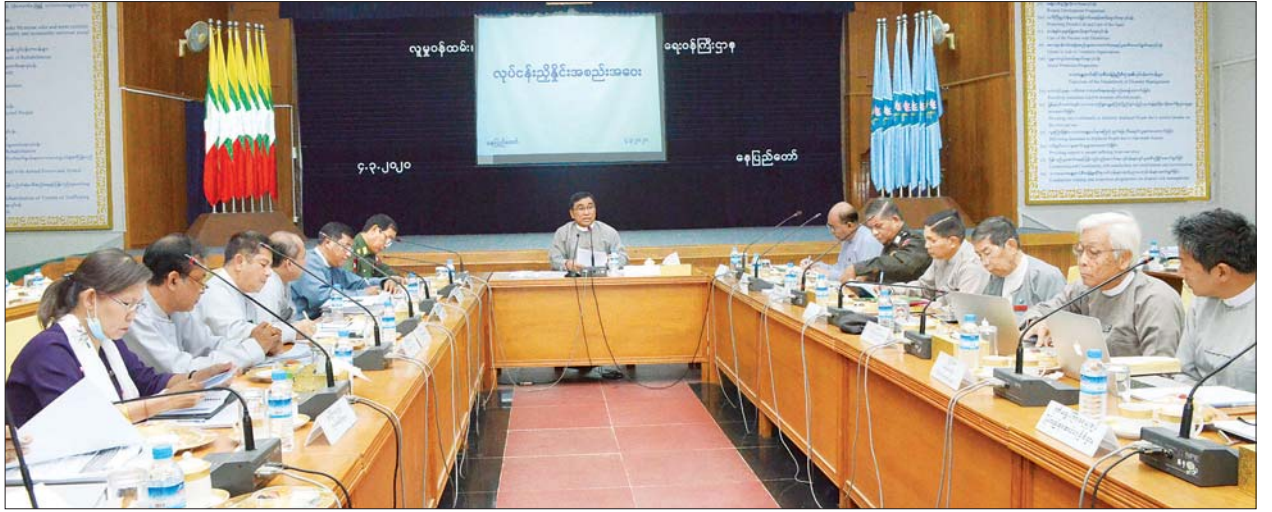
ပြည်ထောင်စုဝန်ကြီး ဒေါက်တာဝင်းမြတ်အေး ရခိုင်ပြည်နယ် မောင်တောခရိုင်အတွင်း ဒေသဖွံ့ဖြိုးတိုးတက်ရေးအတွက် နည်းပညာလုပ်ငန်းအဖွဲ့၏ ကွင်းဆင်းတွေ့ရှိမှုများ အကောင်အထည်ဖော်ဆောင်ရွက်ရေး ညှိနှိုင်းအစည်းအဝေးတွင် အမှာစကားပြောကြားစဉ်။ သတင်းစဉ်

အဆိုပါ အကြမ်းဖက်မှုဖြစ်စဉ်များနှင့်စပ်လျဉ်းပြီး နိုင်ငံတော်က ပွင့်လင်း မြင်သာစွာ သိရှိနိုင်ရေးအတွက် ဒုတိယသမ္မတ ဦးမြင့်ဆွေ ဦးဆောင်ပြီး မောင်တောဒေသ စုံစမ်းစစ်ဆေးရေးကော်မရှင်ကို ဖွဲ့စည်းပြီး စုံစမ်းစစ်ဆေးမှုများ ဆောင်ရွက်ခဲ့ပါကြောင်း၊ ထိုစုံစမ်းစစ်ဆေးရေးကော်မရှင်၏ အစီရင်ခံစာပါ အချက်(၄၈)ချက်နှင့် ရခိုင်ပြည်နယ်ဆိုင်ရာ အကြံပေးကော်မရှင်၏ အကြံပြုချက် (၈၈)ချက်တို့ကို အကောင်အထည်ဖော်ဆောင်ရွက်ခဲ့ကြောင်း၊ သို့သော်လည်း