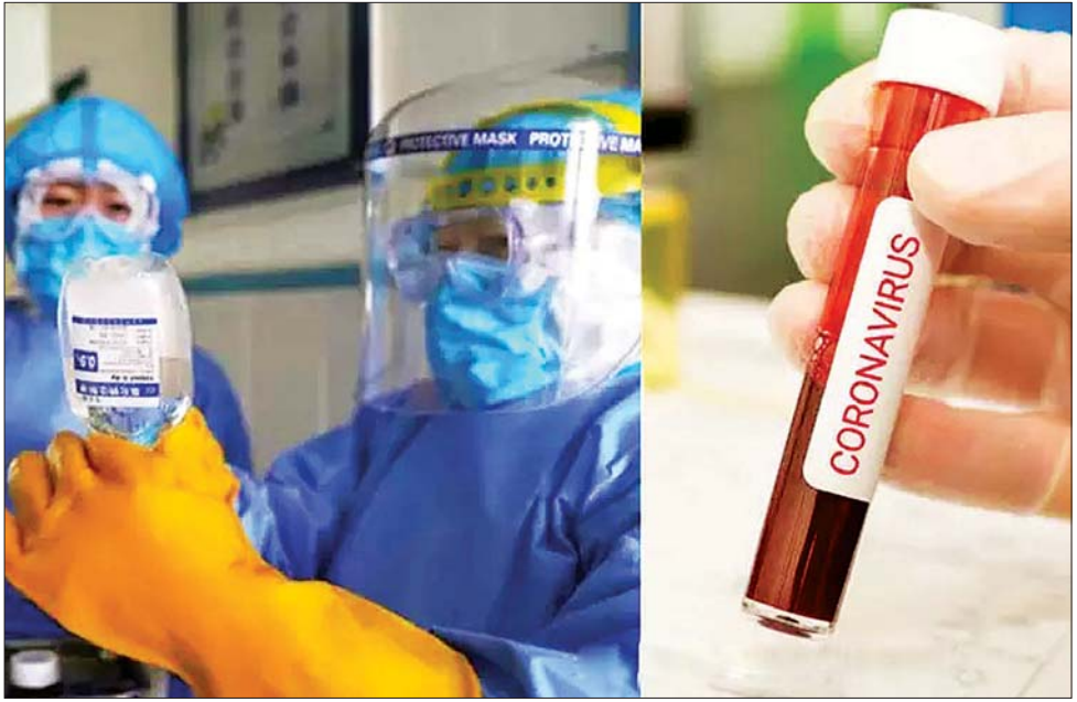
ကိုရိုနာဗိုင်းရပ်စ် ကာကွယ်ဆေးစမ်းသပ်နေသည်ကို တွေ့ရစဉ်။

ဥရောပရဲ့ အဓိက စတော့ဈေးကွက်ဟာလည်း စက်မှုထိပ်သီးနိုင်ငံရဲ့ ကြေညာချက်ထွက်ပေါ်လာပြီးနောက်