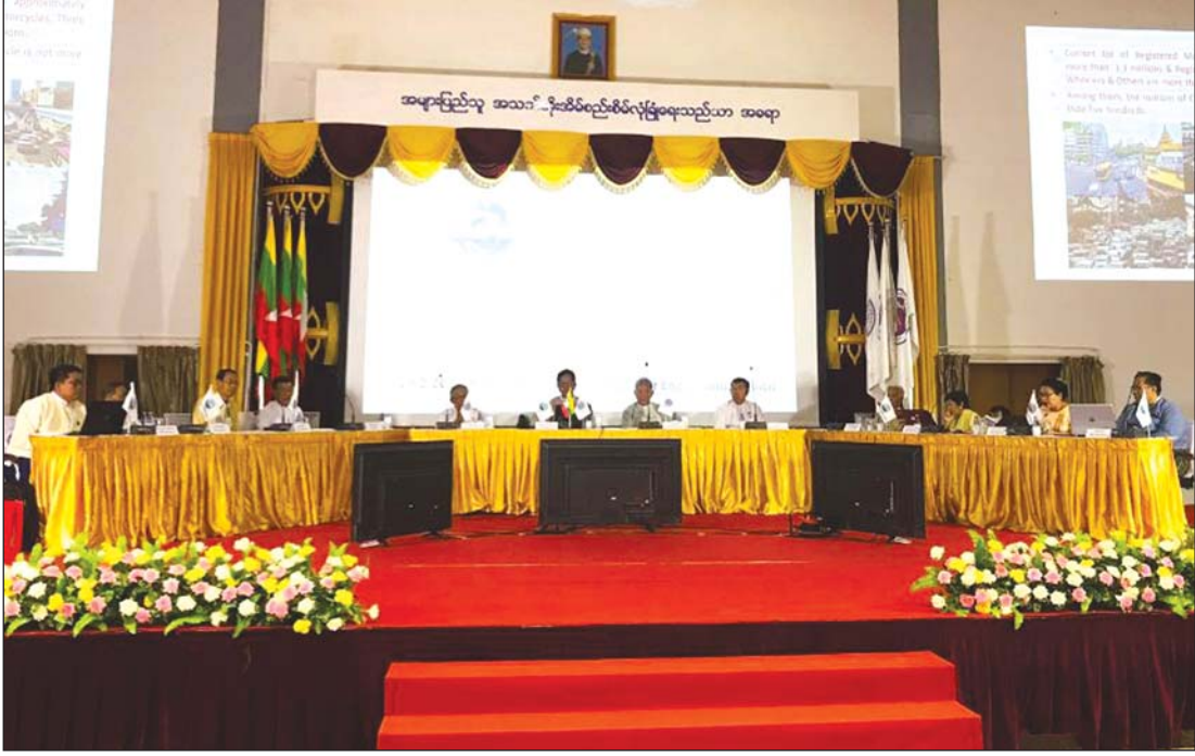
ပထမအကြိမ် မြန်မာ လျှပ်စစ်ယာဉ်နည်းပညာဆိုင်ရာဖိုရမ် ကျင်းပနေစဉ်။

မြန်မာနိုင်ငံ အင်ဂျင်နီယာကောင်စီ၏ ရည်ရွယ်ချက်များထဲတွင် "အင်ဂျင်နီယာနည်းပညာများနှင့် သတင်းအချက်အလက်နည်းပညာများကို ပေါင်းစပ်အသုံးပြုလျက် နိုင်ငံတော်၏ သဘာဝသယံဇာတနှင့် လူသားအရင်းအမြစ်များကို သဘာဝပတ်ဝန်းကျင် ထိခိုက်မှုအနည်းဆုံးဖြင့် အကျိုးရှိစွာ အသုံးပြုနိုင်မည့် နည်းလမ်းကောင်းများ၊ သုတေသနနှင့် ဖွံ့ဖြိုးတိုးတက်မှုနည်းလမ်းများကို ရှာဖွေဖော်ထုတ်ရန်" ဟူသော ရည်ရွယ်ချက်တစ်ရပ်ပါဝင်နေသလို မော်တော်ယာဉ် ထုတ်လုပ်သုံးစွဲမှုဆိုင်ရာ အင်ဂျင်နီယာပညာရှင်များအသင်း(မြန်မာနိုင်ငံ)၏ ရည်ရွယ်ချက်များတွင်လည်း "မော်တော်ယာဉ် တပ်ဆင်ထုတ်လုပ်ခြင်းနှင့် စက်ပစ္စည်းအစိတ်အပိုင်းများ ထုတ်