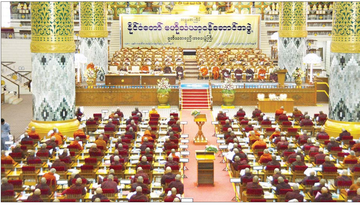
အဋ္ဌမအကြိမ် နိုင်ငံတော်ဗဟိုသံဃာ့ဝန်ဆောင်အဖွဲ့ ဒုတိယအစည်းအဝေး ဒုတိယနေ့ကျင်းပစဉ်။ သတင်းစဉ်

ရန်ကုန် မတ် ၄ အဋ္ဌမအကြိမ် နိုင်ငံတော်ဗဟိုသံဃာ့ဝန်ဆောင်အဖွဲ့ ဒုတိယအစည်းအဝေး ဒုတိယနေ့ကို ယနေ့ နံနက် ၈ နာရီတွင် ရန်ကုန်တိုင်းဒေသကြီး မရမ်းကုန်းမြို့နယ် သီရိမင်္ဂလာ ကမ္ဘာအေးကုန်းမြေရှိ ဆဋ္ဌသင်္ဂါယနာ မဟာပါသာဏလိုဏ်ဂူ သိမ်တော်ကြီး၌ ကျင်းပသည်။ အဆိုပါ အစည်းအဝေးသို့ နိုင်ငံတော်ဥပါဒါစရိယ ဆရာတော်ကြီးများ၊ နိုင်ငံတော်သံဃမဟာနာယက ဆရာတော်ကြီးများ၊ နိုင်ငံတော်ဗဟိုသံဃာ့ဝန်ဆောင်ဆရာတော်ကြီးများ ကြွရောက်တော်မူကြပြီး သာသနာရေးနှင့် ယဉ်ကျေးမှုဝန်ကြီးဌာန ပြည်ထောင်စုဝန်ကြီး သူရဦးအောင်ကိုနှင့် ဌာနဆိုင်ရာတာဝန်ရှိသူများ တက်ရောက်ကြည့်ညိကြသည်။ အစည်းအဝေးတွင် နိုင်ငံတော်ဗဟိုသံဃာ့ဝန်ဆောင်အဖွဲ့ ဒုတိယဥက္ကဋ္ဌ အဂ္ဂမဟာပဏ္ဍိတ၊ အဂ္ဂမဟာသဒ္ဓမ္မဇောတိကဓဇ၊ ဒီပဲဋ်ကဓရ ဘဒ္ဒန္တအဂ္ဂဓမ္မ က သဘာပတိဆရာတော်အဖြစ် ဆောင်ရွက်တော်မူပြီး တွဲဖက်အကျိုးတော်ဆောင် ဆရာတော်အဂ္ဂမဟာပဏ္ဍိတ အဂ္ဂမဟာသဒ္ဓမ္မဇောတိကဓဇ ဘဒ္ဒန္တသီလာစာရာဘိဝံသ က အခမ်းအနားများ ဆရာတော်အဖြစ် ဆောင်ရွက်တော်မူသည်။ ရှေးဦးစွာ အခမ်းအနားများ