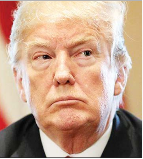
တယ်လီဖုန်းဖြင့် ဆက်သွယ်ဆွေးနွေးခဲ့သည့် တာလီဘန်ခေါင်းဆောင် မူလာအဗ္ဗူလ်ဂါနီဘာရာဒါနှင့် အမေရိကန် သမ္မတ ဒေါ်နယ်ထရပ့််