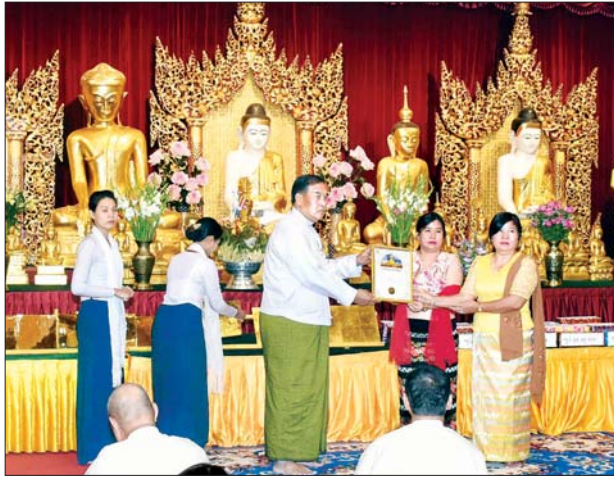
ကျောက်ပြားအလှူရှင်များက ကျောက်ပြား ၅၇၆၂၆ ချပ် လှူဒါန်းခဲ့ကြပြီး ငွေသားအလှူရှင် ၃၀ အပါအဝင် လှူဒါန်းငွေ စုစုပေါင်းငွေကျပ် ၁၅၄၀၅၂၉၅၀ ဖြစ်ကြောင်း သိရသည်။

ရန်ကုန် မတ် ၄ ရွှေတိဂုံစေတီတော် ဘဏ္ဍာတော်ထိန်းဂေါပကအဖွဲ့က စီစဉ်ကျင်းပသော ရွှေတိဂုံစေတီတော်ကြီး၏ (၅၇၇) ကြိမ်မြောက် အလှူတော်ငွေ ပေးအပ်ပွဲအဖြစ် အလှူရှင်များအား ထုတ်အနုမောဒနာ ဂုဏ်ပြုမှတ်တမ်းလွှာ ပြန်လည်ချီးမြှင့်ပွဲ အခမ်းအနားကို ယမန်နေ့က စေတီတော်ရင်ပြင်တော်တောင်ဘက် ရှေးဟောင်းဗုဒ္ဓရုပ်ပွားတော်များ တန်ဆောင်း၌ ကျင်းပသည်။