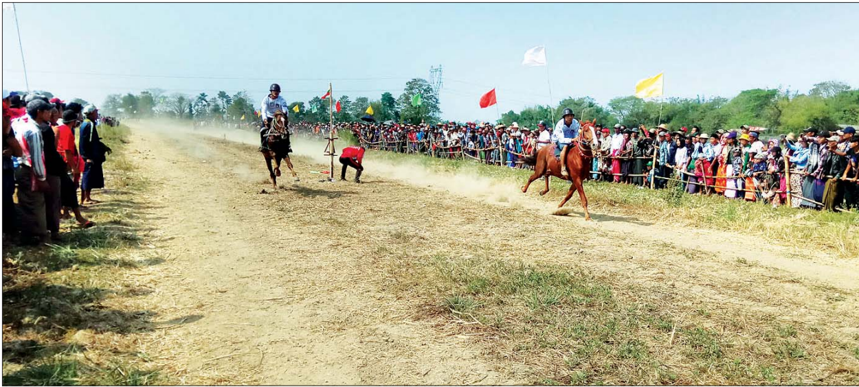
ပန်းတနော်မြို့နယ်၌ မြင်းခုန်းစီးပြိုင်ပွဲ ကျင်းပစဉ်။