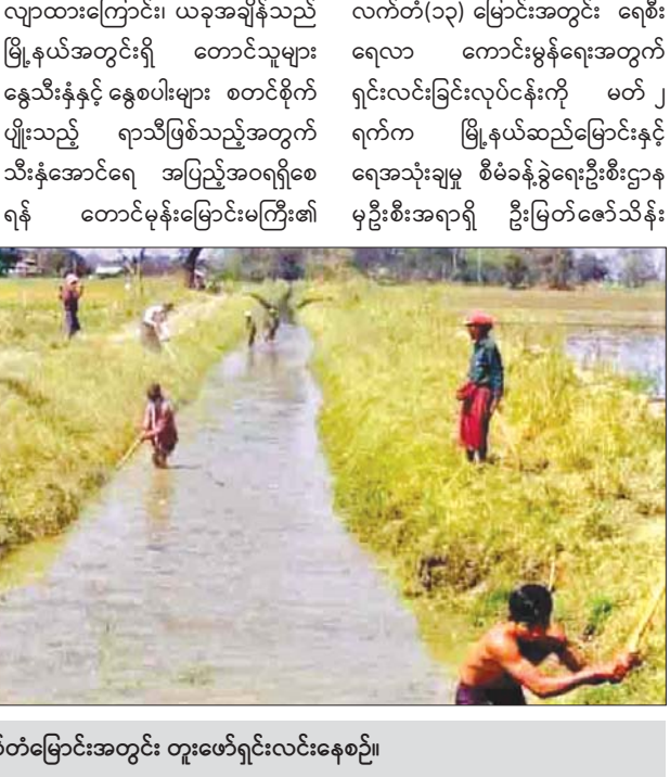
ဆည်မြောင်းလုပ်သားများ ရေပေးလက်တံမြောင်းအတွင်း တူးဖော်ရှင်းလင်းနေစဉ်။

ပွင့်ဖြူ မတ် ၄ မကွေးတိုင်းဒေသကြီး ပွင့်ဖြူမြို့နယ် ၌ ၂၀၁၉-၂၀၂၀ နွေသီးနှံ စိုက်ရာသီတွင် မဲဇလီ ရေလွှဲဆည်မှရေဖြင့် နွေစပါး ၈၇၀၀ နှင့် နွေနှမ်း ၄၀၀၀၇၇ ဧကကို စိုက်ပျိုးသွားရန်