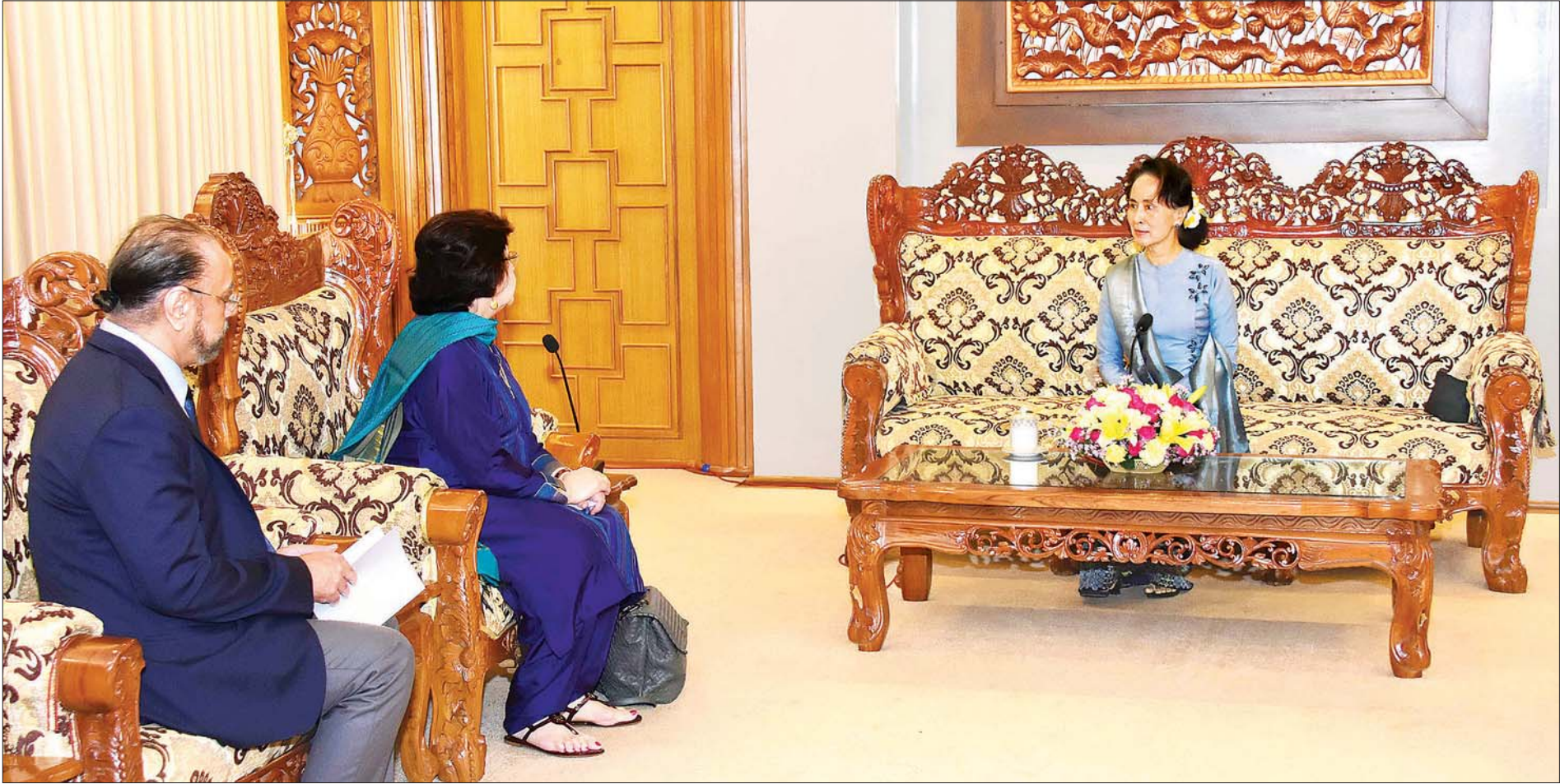
နိုင်ငံတော်၏အတိုင်ပင်ခံပုဂ္ဂိုလ် ဒေါ်အောင်ဆန်းစုကြည် ထိုင်းနိုင်ငံ ဗန်ကောက်အခြေစိုက် International Union for Conservation of Nature (IUCN) ၏ အာရှဆိုင်ရာ ဒေသတွင်းညွှန်ကြားရေးမှူးနှင့် အာရှ-သမုဒ္ဒရာဒေသများဆိုင်ရာ ညွှန်ကြားရေးမှူး Ms. Aban Marker Kabraji အား လက်ခံတွေ့ဆုံစဉ်။ သတင်းစဉ်

၁၃၈၁ ခုနှစ်၊ တပေါင်းလဆန်း ၁၂ ရက် ၂၀၂၀ ပြည့်နှစ်၊ မတ် ၅ ရက်၊ ကြာသပတေးနေ့ အတွဲ (၅၉)၊ အမှတ် (၁၅၇)