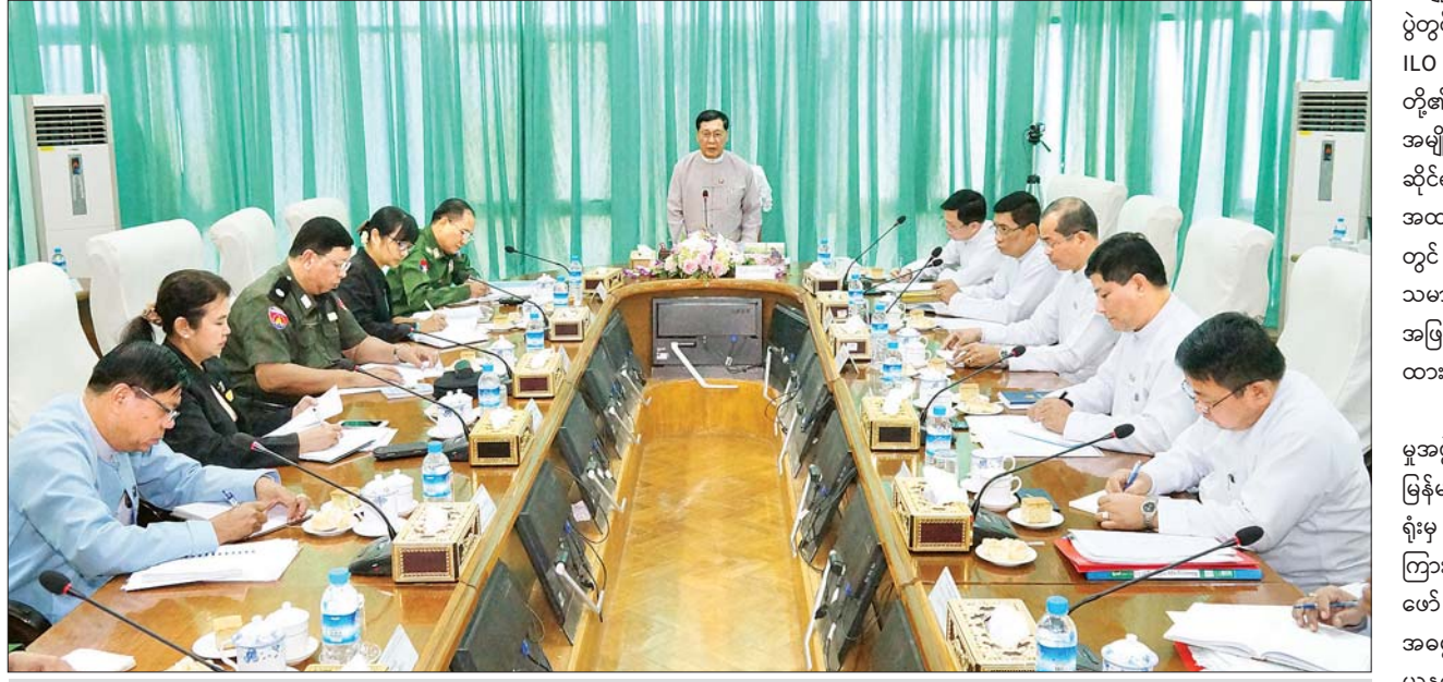
ပြည်ထောင်စုဝန်ကြီး ဦးသိန်းဆွေ အလုပ်သမားရေးရာပူးပေါင်းဆောင်ရွက်ရေးလုပ်ငန်းကော်မတီညှိနှိုင်းအစည်းအဝေးတွင် အမှာစကားပြောကြားစဉ်။ သတင်းစဉ်

(၃၃၇)ကြိမ်မြောက် ILO အုပ်ချုပ်မှုအဖွဲ့ အစည်းအဝေး၏ ဆုံးဖြတ်ချက်များကို အခြေခံ၍ပြုစုထားသည့် အလုပ်သမားရေးရာ ဖြစ်ပေါ်တိုးတက်မှုများနှင့် ပတ်သက်သည့် အချက်အလက်များကို Information Sheet ပြုစုပြီး သက်ဆိုင်ရာဌာနများ၏ ပူးပေါင်းဆောင်ရွက်မှုကြောင့် ဂျီနီဗာ၊ မြန်မာအမြဲတမ်း ကိုယ်စားလှယ်အဖွဲ့ရုံးကို အချက်အလက်များ အချိန်မီပေးပို့နိုင်ခဲ့ပါကြောင်း။ HLWG အဖွဲ့ဝင်များအနေဖြင့် အမေ့ခိုင်းစေမှုဆိုင်ရာတိုင်ကြားချက်များကို အမြန်ဆုံး ဖြေရှင်းဆောင်ရွက်နိုင်ရေး Standard Operation Procedure - SOP ကို နိုင်ငံတကာစံများနှင့် အညီဆွေးနွေးပြီး အမြန်ဆုံးဖြေရှင်းပေးနိုင်ရေး အဖွဲ့ဝင်များအနေဖြင့် SOP ရေးဆွဲကာ မိမိတို့ဝန်ကြီးဌာနသို့ အမြန်ဆုံးပေးပို့စေလိုပါကြောင်းနှင့် National Complaints Mechanism - NCM လုပ်ငန်းစဉ်များနှင့် ပတ်သက်၍ တက်ရောက်လာသူများမှ အားလုံးပိုင်းဝန်းပူးပေါင်းဆောင်ရွက်သွားကြရန် တိုက်တွန်းပြောကြားသည်။