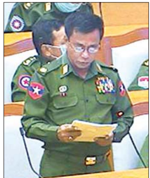
တပ်မတော်သား ပြည်သူ့လွှတ်တော်ကိုယ်စားလှယ် ဗိုလ်မှူးချုပ် ရဲနိုင်မျိုး

ပါကြောင်း၊ ထို့ကြောင့် ပြင်ဆင်သင့် ပြင်ဆင်ထိုက်သည့် အချိန်အခါနှင့် အခြေအနေရောက်ပါက ပြင်ဆင်ရမည်ဖြစ်ပါကြောင်း၊ ယခုအချိန်တွင် ဖွဲ့စည်းပုံအခြေခံဥပဒေပုဒ်မ ၄၃၆ ပြင်ဆင်ခြင်း၏ နောက်ဆက်တွဲ ပေါ်ပေါက်လာနိုင်သည့် ကိစ္စများကို အဘက်ဘက်မှ ချင့်ချိန်သုံးသပ်ရန် လိုအပ်နေသေးသည့် အခြေအနေအချိန်အခါဖြစ်သောကြောင့် ပုဒ်မ ၄၃၆ ပုဒ်မခွဲ (က)ကို ပြင်ဆင်ရန်မသင့်ဘဲ မူလအတိုင်းသာ ထားရှိသင့်ပါကြောင်း ဆွေးနွေးသည်။