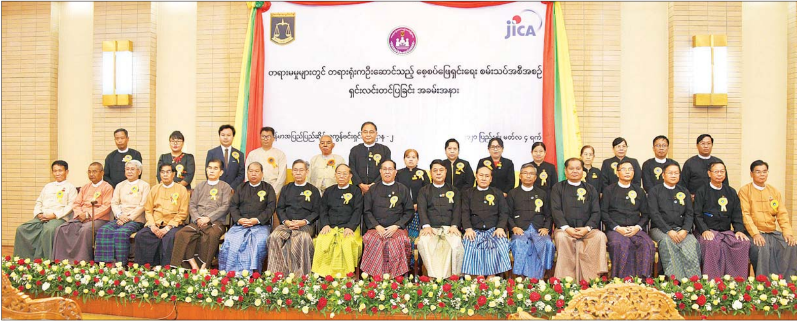
ပြည်ထောင်စုတရားသူကြီးချုပ် ဦးထွန်းထွန်းဦး အခမ်းအနားသို့ တက်ရောက်လာကြသူများနှင့် စုပေါင်းမှတ်တမ်းတင်ဓာတ်ပုံရိုက်စဉ်။ သတင်းစဉ်

အခမ်းအနားတွင် ပြည်ထောင်စုတရားသူကြီးချုပ် ဦးထွန်းထွန်းဦးက ပြည်ထောင်စု တရားလွှတ်တော်ချုပ် အနေဖြင့် တရားစီရင်ရေးမဟာဗျူဟာ စီမံကိန်း (၂၀၁၈-၂၀၂၂) ၏ မဟာဗျူဟာရည်မှန်းချက် ၅ ဒသမ ၃ တွင် အငြင်းပွားမှုများကို တရားရုံးက ထိရောက်မြန်ဆန်စွာ ဖြေရှင်းပေးသော စနစ်များကို သတ်မှတ်ဆောင်ရွက်ရန် ရည်မှန်းချက်နှင့်အညီ ၂၀၁၉ ခုနှစ်က ခရိုင်တရားရုံး နှစ်ရုံးနှင့် မြို့နယ်တရားရုံး နှစ်ရုံးတို့တွင် “တရားမမှုများတွင် တရားရုံးက ဦးဆောင်သည့် စေ့စပ်ဖြေရှင်းရေး စမ်းသပ်အစီအစဉ်” ကို စတင်အကောင်အထည်ဖော် ဆောင်ရွက်နိုင်ခဲ့ကြောင်း၊ တစ်နှစ်တာ ဆောင်ရွက်ချက်၏ ရလဒ်များအရ စမ်းသပ်အစီအစဉ်ကို ပိုမိုကျယ်ပြန့်စွာ ဆောင်ရွက်သင့်သည်ဟု သုံးသပ်တွေ့ရှိရသည့်အတွက် ယခုနှစ် ၂၀၂၀ ပြည့်နှစ်တွင် မန္တလေးတိုင်းဒေသကြီး၊ နေပြည်တော်ကောင်စီ နယ်မြေ၊ ဒက္ခိဏာခရိုင်အတွင်းရှိ ပျဉ်းမနားမြို့နယ်တရားရုံး၊ လယ်ဝေးမြို့နယ်တရားရုံး၊ ဇမ္ဗူသီရိမြို့နယ်တရားရုံး၊ ပုဗ္ဗသီရိမြို့နယ်တရားရုံး၊ ဥတ္တရသီရိမြို့နယ်တရားရုံးနှင့် ဒက္ခိဏာသီရိမြို့နယ်တရားရုံးတို့တွင် ယင်းစမ်းသပ်အစီအစဉ်ကို တိုးချဲ့ဆောင်ရွက်သွားမည်ဖြစ်ကြောင်း၊ ယခုကဲ့သို့