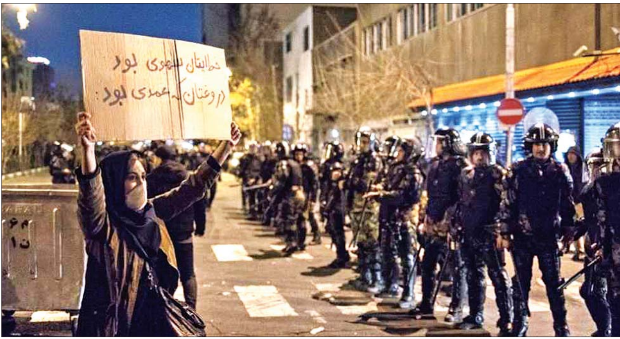
အစိုးရကို ဆန့်ကျင်သည့် ဆန္ဒပြသူတစ်ဦးကို တွေ့ရစဉ်။

တီဟီရန် မတ် ၄ ပြီးခဲ့သည့် နိုဝင်ဘာလအတွင်းက အီရန်၌ အစိုးရကို ဆန့်ကျင်သည့် ဆန္ဒပြသူများအပေါ် အီရန်လုံခြုံရေး တပ်ဖွဲ့ဝင်များက အင်အားသုံးနှိမ်နင်းမှုကြောင့် ကလေးငယ် ၂၃ ဦးအထိ သေဆုံးခဲ့ကြောင်း လူ့အခွင့်အရေး အဖွဲ့တစ်ဖွဲ့ဖြစ်သည့် နိုင်ငံတကာ လွတ်ငြိမ်းချမ်းသာမှုအဖွဲ့က စွပ်စွဲပြောကြားလိုက်သည်။ ရေနံဈေးရုတ်တရက် မြင့်တက်သွားကြောင်း ကြေညာလိုက်ပြီးနောက် နိုဝင်ဘာ ၁၅ ရက်မှ စတင်ကာ အီရန်နိုင်ငံတစ်ဝန်းတွင် အစိုးရကို ဆန့်ကျင်သည့် ဆန္ဒပြပွဲများပေါ်ပေါက်ခဲ့သည်။ အာဏာပိုင်များက ဆန္ဒပြသူများအား အင်အားသုံးနှိမ်မှုများ လုပ်ဆောင်ခဲ့ရာ ဆန္ဒပြသူ ၃၀၄ ဦး သေဆုံးခဲ့ကြောင်း နိုင်ငံတကာ လွတ်ငြိမ်းချမ်းသာမှုအဖွဲ့က ပြောကြားခဲ့သည်။ ကလေးငယ် ၂၃ ဦးထက်မနည်း အသတ်ခံခဲ့ရသည့် သက်သေအထောက်အထားများရှိကြောင်းနှင့် ၎င်းတို့ အနက် ၂၂ ဦးမှာ လုံခြုံရေး တပ်ဖွဲ့ဝင်များ၏ လက်ချက်ကြောင့် သေဆုံးခြင်းဖြစ်ကြောင်း အဖွဲ့က