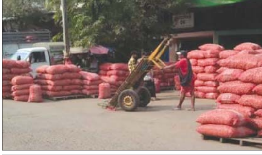
ရန်ကုန်မြို့ ဘုရင့်နောင်ရုံ ကြက်သွန်နီပွဲရုံတစ်ရုံ

ရန်ကုန် မတ် ၄ ဖေဖော်ဝါရီ ၂၅ ရက်မှစ၍ ရန်ကုန်အပါအဝင် နယ်စပ်ကျေးရွာများ၌ ကြက်သွန်နီဈေးနှုန်း ကျဆင်းနေရာမှ မတ် ၃ ရက်တွင် ဈေးနှုန်း ပြန်လည်မြင့်တက်လာသည်ဟု ဘုရင့်နောင်ပွဲရုံများမှ သိရသည်။ ဘင်္ဂလားဒေ့ရှ်နိုင်ငံသို့ တင်ပို့မှုများကြောင့် ဖေဖော်ဝါရီ ၂၀ ရက်က ဆိပ်ဖြူကြက်သွန်နီ လက်ကားဈေးမှာ တစ်ပိဿာလျှင် ကျပ် ၁၃၀၀ မှ ၁၅၅၀ အထိနှင့် မြစ်သားကြက်သွန်နီမှာ ကျပ် ၁၃၅၀ မှ ၁၈၀၀ နှုန်းအထိ ဈေးအမြင့်တွင်ရှိခဲ့ပြီး ဖေဖော်ဝါရီ ၂၅ ရက်မှစ၍ ဘင်္ဂလားဒေ့ရှ်သို့ပို့ရန် အဝယ်နည်းလာပြီး ရန်ကုန်ဈေးကွက်သို့ တင်ပို့မှုများလာခြင်းကြောင့် ဈေးကျလာခဲ့ရာ ဆိပ်ဖြူ လက်ကား တစ်ပိဿာလျှင် ကျပ် ၇၀၀ မှ ၈၀၀ နှင့် မြစ်သား တစ်ပိဿာလျှင် ကျပ် ၈၀၀ မှ ၁၀၀၀