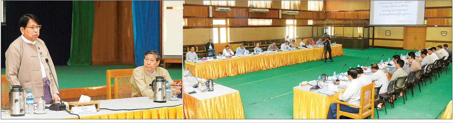
ပြည်ထောင်စုဝန်ကြီး ဒေါက်တာဖေမြင့် ၂၀၂၀-၂၀၂၁ ပညာသင်နှစ်အတွက် ကျောင်းသုံးစာအုပ်များ ပုံနှိပ်၊ ထုတ်လုပ်၊ ဖြန့်ချိရေးလုပ်ငန်းများ အချိန်မီဆောင်ရွက်နိုင်ရေး ညှိနှိုင်းအစည်းအဝေးတွင် အမှာစကားပြောကြားစဉ်။

နေပြည်တော် မတ် ၄ ၂၀၂၀-၂၀၂၁ ဘဏ္ဍာရေးနှစ် (၂၀၂၀-၂၀၂၁) ပညာသင်နှစ်အတွက် ကျောင်းသုံးစာအုပ်များ ပုံနှိပ်၊ ထုတ်လုပ်၊ ဖြန့်ချိရေးလုပ်ငန်းများ အချိန်မီဆောင်ရွက်နိုင်ရေး ညှိနှိုင်း အစည်းအဝေးကို ယနေ့ မွန်းလွဲ ၂ နာရီ က နေပြည်တော်ရှိ ပြန်ကြားရေး ဝန်ကြီးဌာန၌ ကျင်းပသည်။ အစည်းအဝေးတွင် ကျောင်းသုံး စာအုပ်များ ရိုက်နှိပ်ဖြန့်ချိရေး ကော်မတီဥက္ကဋ္ဌ ပြန်ကြားရေးဝန်ကြီး ဌာန ပြည်ထောင်စုဝန်ကြီး ဒေါက်တာ ဖေမြင့်က ပညာရေးဝန်ကြီးဌာန၏ ကျောင်းသုံးပြဋ္ဌာန်းစာအုပ်များ ပုံနှိပ် ခြင်းလုပ်ငန်းစဉ်တွင် ပြန်ကြားရေး ဝန်ကြီးဌာနက အစဉ်အမြဲပေးပေါင်း ပါဝင်ဆောင်ရွက်နေမှု၊ ထိုသို့ဆောင် ရွက်ရာတွင် ပြန်ကြားရေးဝန်ကြီးဌာန အောက်ရှိ ပုံနှိပ်ရေးနှင့် ထုတ်ဝေရေး ဦးစီးဌာနက ကျောင်းသုံးပြဋ္ဌာန်း စာအုပ်များ ပုံနှိပ်ခြင်းလုပ်ငန်းကို ဆောင်ရွက်နေမှု၊ ပုံနှိပ်ရေးနှင့် ထုတ်ဝေရေးဦးစီးဌာနက ပုံနှိပ်နိုင် သည့်အရေအတွက်ထက် ကျော်လွန် သည့် စာအုပ်များကို ပုဂ္ဂလိကပုံနှိပ် လုပ်ငန်းရှင်များထံ တင်ဒါစိစစ်ရေး ကော်မတီမှတစ်ဆင့် တင်ဒါစည်းမျဉ်း စည်းကမ်းများနှင့်အညီ လုပ်ငန်း