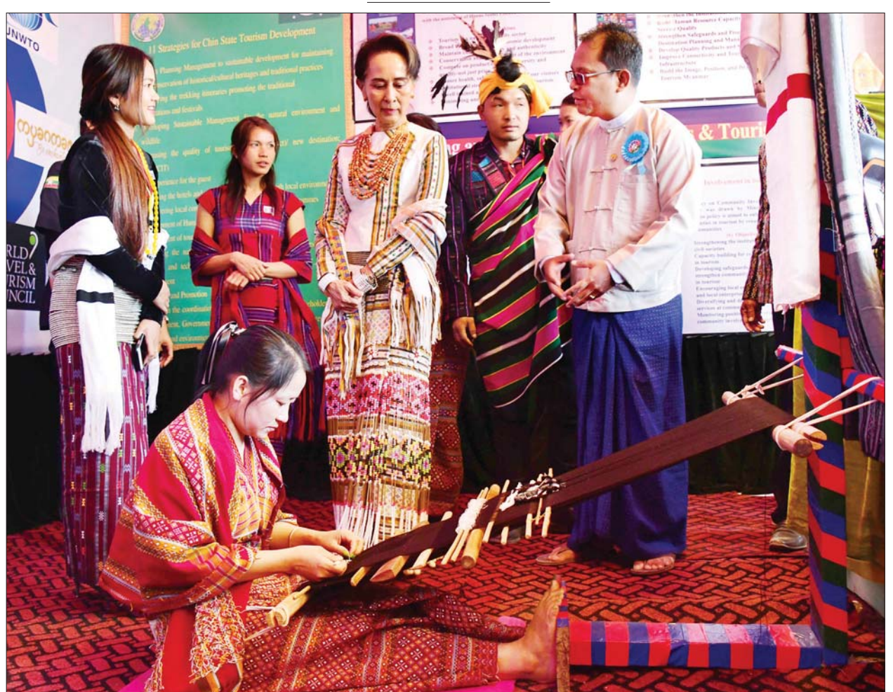
နိုင်ငံတော်၏အတိုင်ပင်ခံပုဂ္ဂိုလ် ဒေါ်အောင်ဆန်းစုကြည် (၇၂)နှစ်မြောက် ချင်းအမျိုးသားနေ့အထိမ်းအမှတ် ဒေသခံယဉ်ကျေးမှုပြခန်းကို ကြည့်ရှု အားပေးစဉ်။ သတင်းစဉ်

သမိုင်းဝင်နေ့တစ်နေ့ဖြစ် ထိုပြင် အင်္ဂလိပ်နယ်ချဲ့လက်ထက် ရခိုင်တောင်တန်းဒေသအုပ်ချုပ်ရေး ထံတွင် ပါဝင်နေသည့် ပလက်ပဒေသ ကို လည်းကောင်း၊ မကွေးတိုင်းဒေသ ၏ အုပ်ချုပ်မှုအောက်တွင် ရောက်နေ သည့် ကန့်ပက်လက်ဒေသကို လည်းကောင်း ၁၉၄၇ ခုနှစ် ဖွဲ့စည်း အုပ်ချုပ်ပုံအခြေခံဥပဒေအရ ဖွဲ့စည်း ဖြစ်ပေါ်လာသည့် ချင်းဝိသေသတိုင်း ထံသို့ တစ်စိတ်တစ်ပိုင်းတည်း ပါဝင်လာ သည့်အတွက် ယနေ့ ချင်းပြည်နယ်ဟု စည်းလုံးညီညွတ်စွာဖြစ် တည်လာ သည့် သမိုင်းဝင်နေ့တစ်နေ့ ဖြစ်သည်။ နှစ်စဉ်ကျင်းပလျက်ရှိ ဖေဖော်ဝါရီ (၂၀)ရက်သည် ချင်းအမျိုးသား တစ်ရပ်လုံးအတွက် ထူးခြားဂုဏ်ယူဖွယ်ရာ နေ့ထူး နေ့မြတ်အဖြစ် ချင်းရေးရာကောင်စီ က သတ်မှတ်ထားသည့် ချင်းအမျိုး သားနေ့ကို အထွတ်အမြတ်ထား၍ နှစ်စဉ်ကျင်းပလျက်ရှိကြောင်း သိရ သည်။ သတင်းစဉ်