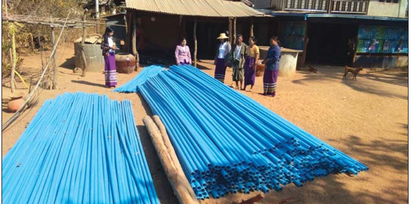
ပိုက်လိုင်းသွယ်တန်းရန် စုဆောင်းထားသော ရေပိုက်များ