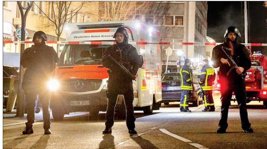
သေနတ်ပစ်ခတ်မှုဖြစ်ပွားခဲ့သည့် အဆောက်အအုံရှေ့တွင် ကင်းလှည့်နေသည့် လုံခြုံရေးတပ်ဖွဲ့ဝင်များ။

ဟက်ဆီ အလယ်ပိုင်းဒေသမှ ရဲတပ်ဖွဲ့၏ ပြောပြချက်အရ လွတ် မြောက်သွားသည့် သေနတ်ပစ်ခတ်မှုကို ခြေရာခံ လိုက်ခဲ့ပြီးနောက်တွင် အဆိုပါသေနတ်ပစ်ခတ်မှုကို ၎င်း၏ နေအိမ်တွင်သေဆုံးလျက် တွေ့ရှိခဲ့ရ ကြောင်းနှင့် အဆိုပါအဆောက်အအုံ၌ ပစ်ခတ်ထပ်အလောင်းတစ်လောင်း ကို တွေ့ရှိခဲ့ကြောင်း သိရသည်။ မြို့လယ်ကောင်ရီ Midnight ဘား၌ ည ၁၀ နာရီခန့်တွင် သေနတ် ပစ်ခတ်မှုတစ်ခု ဦးစွာဖြစ်ပွားခဲ့ ကြောင်း သတင်းရင်းမြစ်များက ဖော်ပြသည်။ ဘားအဆောက်အအုံ ရှေ့တွင် သေနတ်သံများကြားခဲ့ရပြီး လူသုံးဦးသေဆုံးခဲ့ကြောင်း မျက်မြင် သက်သေများက ပြောသည်။ သေနတ် သမားသည် အခင်းဖြစ်နေရာမှ ကားမောင်း၍ ထွက်ပြေးသွားခဲ့ပြီး