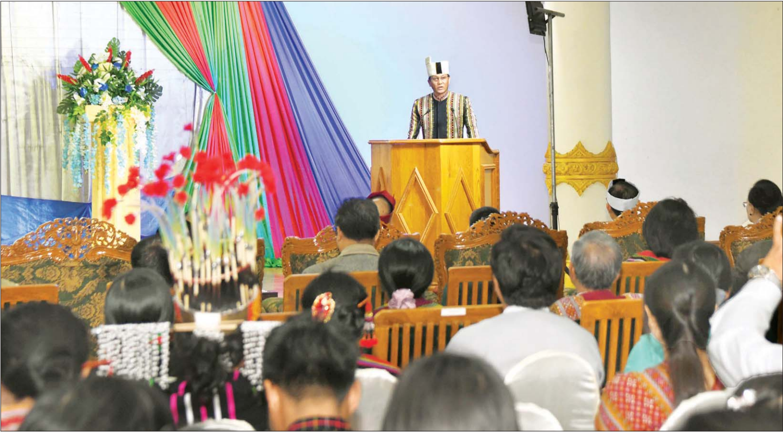
ဒုတိယသမ္မတ ဦးဟင်နရီဗန်ထီးယူ (၇၂)နှစ်မြောက် ချင်းအမျိုးသားနေ့အခမ်းအနားတွင် နှုတ်ခွန်းဆက်အမှာစကား ပြောကြားစဉ်။ သတင်းစဉ်

ချင်းအမျိုးသားနေ့ဆိုသည်မှာ တိုက်သူကြီးများ (စော်ဘွားများ) အုပ်ချုပ်သည့်စနစ်မှ ဒီမိုကရေစီ အုပ်ချုပ်ရေးစနစ်သို့ ပြောင်းလဲ ကျင့်သုံးရန် ဆုံးဖြတ်ချက်ချမှတ်ခဲ့ ခြင်းကို အခြေခံပြီး သတ်မှတ်ခဲ့သည့် နေ့တစ်နေ့ပင်ဖြစ်ပါကြောင်း။ ထိုသို့ အုပ်ချုပ်မှုစနစ် တစ်ခုကနေ နောက် စနစ်တစ်ခုကို ပြောင်းခဲ့ခြင်းသည် လွယ်လွယ်ကူကူဖြင့် ဆောင်ရွက် နိုင်ခဲ့ကြခြင်း မဟုတ်ဘဲ ခက်ခဲသည့် သမိုင်းနောက်ခံများကြားကနေ ချင်း အမျိုးသား အများစု၏ ဘုံသဘော တူညီချက်ဖြင့် သတ်မှတ်ဆောင်ရွက် နိုင်ခဲ့ကြခြင်း ဖြစ်ပါကြောင်း။ ချင်း