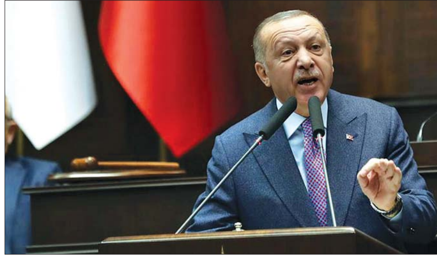
တူရကီသမ္မတ ရီဆက်တေယစ်အာဒိုဂန်

ဆီးရီးယားကို ထိုးစစ်ဆင်တိုက်ခိုက်မည်ဟု တူရကီသမ္မတ သတိပေး အန်ကာရာ ဖေဖော်ဝါရီ ၂၀ မည်ဖြစ်ကြောင်း တူရကီသမ္မတ ရီဆက်တေယစ်အာဒိုဂန်က ယမန်နေ့ တွင် သတိပေး ပြောကြားလိုက်သည်။ ပြည်နယ်မှ ဆုတ်ခွာသွားခြင်းမရှိ သေးလျှင် တူရကီအနေဖြင့် ဆီးရီးယားကို ထိုးစစ်ဆင်တိုက်ခိုက် မည်ဖြစ်ကြောင်း တူရကီသမ္မတ ရီဆက်တေယစ်အာဒိုဂန်က ယမန်နေ့ တွင် သတိပေး ပြောကြားလိုက်သည်။ ပြည်နယ်၌ ထိုးစစ်ဆင်တိုက်ခိုက်မှု တစ်ခု အချိန်မရွေးကျရောက်လာနိုင် ကြောင်း ပါလီမန်လွှတ်တော်၌ မိန့်ခွန်းပြောကြားခဲ့စဉ် အတွင်း သမ္မတ က ပြောကြားခဲ့သည်။ မော်စကို၌ တူရကီနှင့် ရုရှား ကိုယ်စားလှယ်များအကြား ပြုလုပ်ခဲ့ သည့် ဆွေးနွေးပွဲများသည် အီဒလစ် ပြည်နယ်တွင် တင်းမာမှု ပဋိပက္ခများ လျော့ကျစေရန် ရည်ရွယ်ခြင်းဖြစ်ပြီး ဘုံသဘောတူညီမှုရရှိရန် ကြိုးပမ်းမှု မဟုတ်ကြောင်း သို့ရာတွင် နှစ်နိုင်ငံလုံး က ဆွေးနွေးပွဲများ ဆက်လက်ပြုလုပ် ရန်လိုကြောင်း သမ္မတ အာဒိုဂန်က ပြောကြားခဲ့သည်။ ကဲမကောင်းစွာဖြင့် ကျွန်ုပ်တို့၏ ဆွေးနွေးမှုများသည် မျှော်မှန်းသည့် ရလဒ်များ မရရှိခဲ့ကြောင်း ဆွေးနွေးပွဲ များကို ဆက်လက် လုပ်ဆောင်နေ သော်လည်း ကျွန်ုပ်တို့၏ သဘောထား အမြင်များမှာ တစ်ဖက်နှင့် တစ်ဖက် လွန်စွာ အလှမ်းကွာဟလျက်ရှိကြောင်း ၎င်းက ဖြည့်စွက်ပြောခဲ့သည်။ အီဒလစ်ပြည်နယ်၌ ဆီးရီးယား အစိုးရအဖွဲ့၏ တိုက်ခိုက်မှုကြောင့် တူရကီတပ်ဖွဲ့ဝင် ၁၃ ဦး ကျဆုံးခဲ့ ကြောင်း တူရကီဘက်မှ အတည်ပြု ခဲ့ပြီးနောက် တွင် အီဒလစ် ပြည်နယ်၌ တင်းမာမှုအခြေအနေများ အရှိန်မြင့်လာခဲ့သည်။ ဆင်ဟွာ