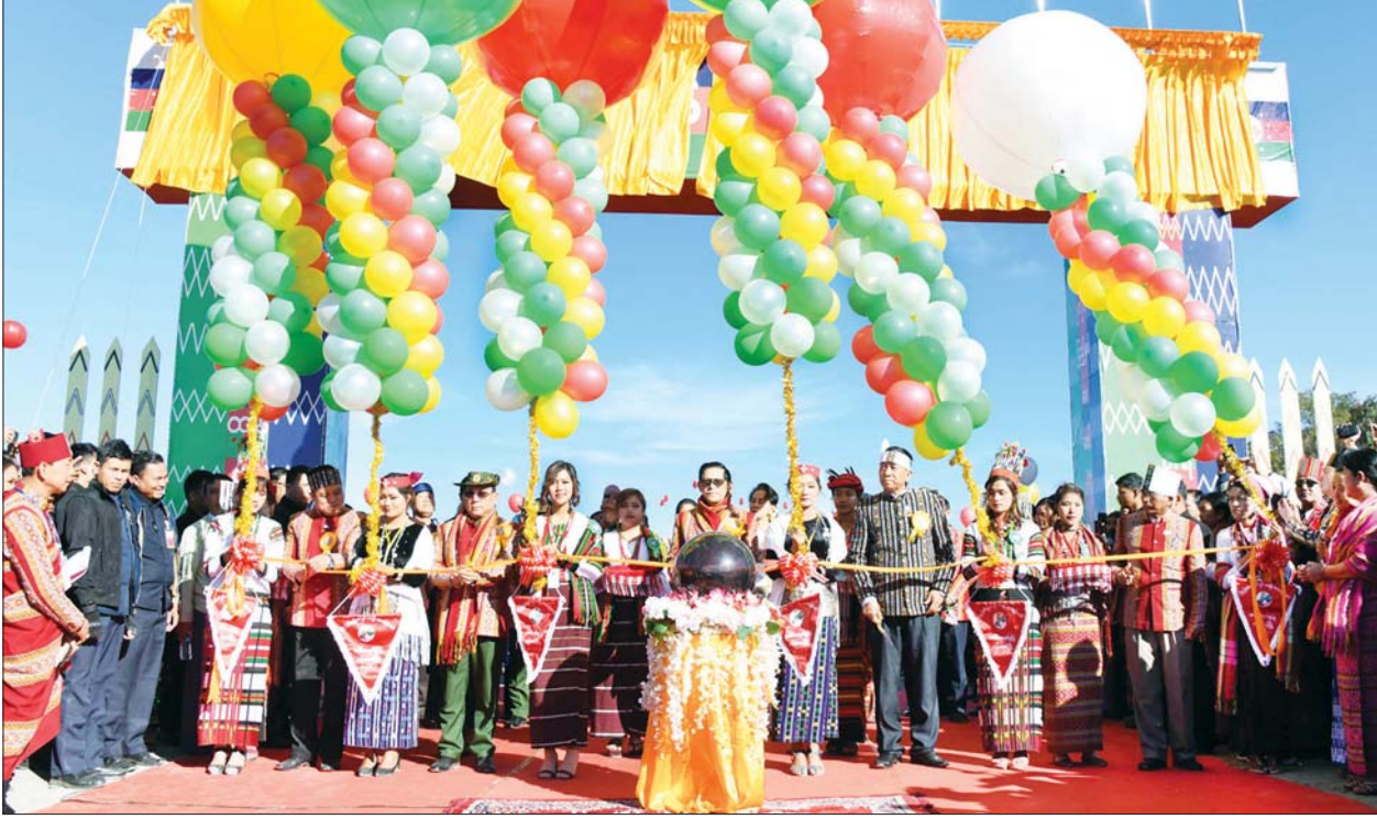
ပြည်ထောင်စုဝန်ကြီး ဦးမင်းသူ၊ ပြည်ထောင်စုဝန်ကြီး ဒုတိယဗိုလ်ချုပ်ကြီးရဲအောင်၊ ချင်းပြည်နယ်အစိုးရအဖွဲ့ဝန်ကြီးချုပ် ဦးဆလှိုင်လျန်လွယ်၊ ချင်းပြည်နယ် လွှတ်တော်ဥက္ကဋ္ဌ ဦးစိုဘွဲ့နှင့် မြို့မိမြို့မ ဦးဌာန်ဟရန်းတို့က (၇၂)နှစ် မြောက် ချင်းအမျိုးသားနေ့အခမ်းအနားကို ဖကြီးဖြတ်ဖွင့်လှစ်ပေးစဉ်။ သတင်းစဉ်

ချင်းမျိုးချစ်စစ်သည်တော်များက “ချင်းတိုင်းရင်းသားများ ပညာရေး မြှင့်တင်ရေးအဖွဲ့” ကို ၁၉၃၈ ခုနှစ် ဖေဖော်ဝါရီ ၂၀ ရက်တွင် မေမြို့၌ ဖွဲ့စည်းခဲ့ပြီး ချင်းတိုင်းရင်းသားများ ၏ပညာမျက်စိကို အလင်းဖွင့်ပေးကာ အမျိုးသားစိတ်ဓာတ် ရှင်သန် ထက်မြက်ရေးကို မီးမောင်းထိုး ဖော်ဆောင်ပေးခဲ့သော အမျိုးသားရေး စာမျက်နှာ ၅ သို့