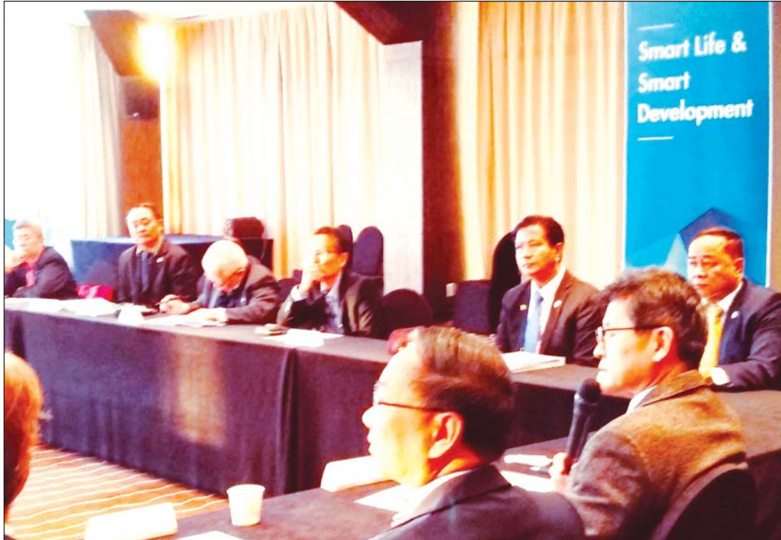
(၇)ကြိမ်မြောက် အာဆီယံ-ကိုရီးယားအင်ဂျင်နီယာပညာရပ်ဆိုင်ရာ ဖိုရမ်သို့ မြန်မာအင်ဂျင်နီယာပညာရှင် တက်ရောက်နေစဉ်

ယခုကျင်းပခဲ့သည့် အာဆီယံ-ကိုရီးယား အင်ဂျင်နီယာပညာရပ်ဆိုင်ရာ ဖိုရမ်သည် သတ္တမ အကြိမ်မြောက်ဖြစ်ပြီး ပထမအကြိမ်မြောက် အာဆီယံ-ကိုရီးယားဖိုရမ်ကို ၂၀၁၃ ခုနှစ်က ကိုရီးယား သမ္မတနိုင်ငံ ဆိုးလ်မြို့၌လည်းကောင်း၊ ဒုတိယအကြိမ်မြောက်ဖိုရမ်ကို ၂၀၁၄ ခုနှစ်က အင်ဒိုနီးရှား