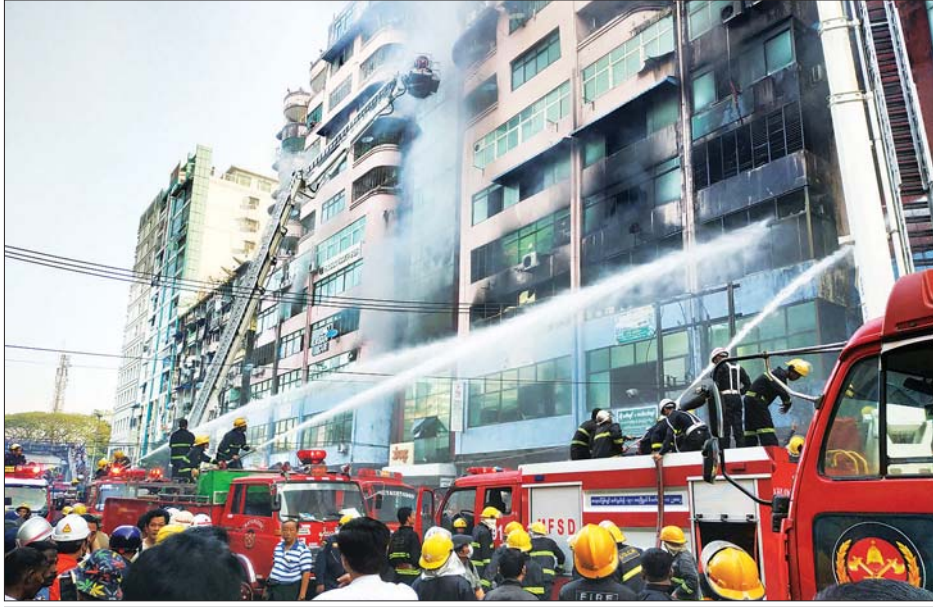
ရန်ကုန်မြို့ သံဈေးမီးလောင်မှုအား မီးသတ်တပ်ဖွဲ့ဝင်များက ငြိမ်းသတ်ကြစဉ်။

မီးလောင်သည့် အဆောက်အအုံမှာ ၁၂ ထပ်ခွဲရှိပြီး