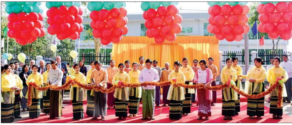
စီမံကိန်း၊ ဘဏ္ဍာရေးနှင့် စက်မှုဝန်ကြီးဌာန ဒုတိယဝန်ကြီး ဦးမောင်မောင်ဝင်းနှင့် တာဝန်ရှိသူများ ပြည်သူ့ဘဏ္ဍာရေး စီမံခန့်ခွဲမှုသင်တန်းကျောင်းအား ဖွင့်ပွဲဖြင့်ဖွင့်လှစ်ပေးစဉ်။

နေပြည်တော် ဖေဖော်ဝါရီ ၂၀ စီမံကိန်း၊ ဘဏ္ဍာရေးနှင့် စက်မှုဝန်ကြီးဌာန ရသုံးမှန်းခြေငွေစာရင်းဦးစီးဌာန က ကြီးမှူးဖွင့်လှစ်သည့် မြန်မာနိုင်ငံ၏ ပထမဆုံး ပြည်သူ့ဘဏ္ဍာရေးစီမံခန့်ခွဲမှုသင်တန်းကျောင်း ဖွင့်ပွဲ အခမ်းအနားကို ဖေဖော်ဝါရီ ၁၈ ရက် က နေပြည်တော်ရှိ အဆိုပါသင်တန်း ကျောင်း၌ ကျင်းပသည်။