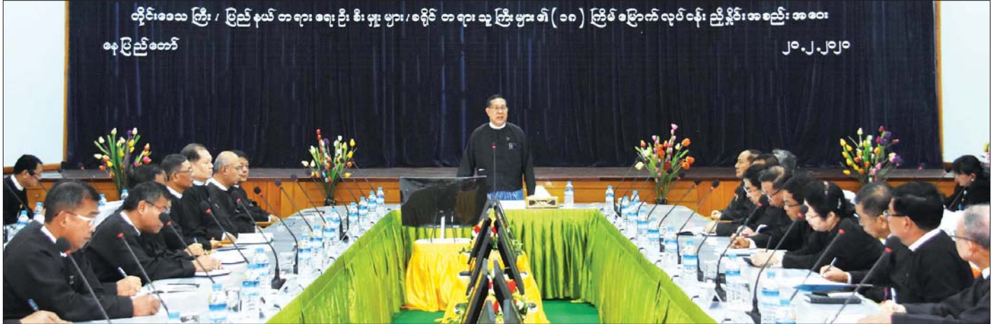
ပြည်ထောင်စုတရားသူကြီးချုပ် ဦးထွန်းထွန်းဦး ပြည်ထောင်စုတရားလွှတ်တော်ချုပ်နှင့် တိုင်းဒေသကြီး/ပြည်နယ် တရားလွှတ်တော်များ၊ ခရိုင်တရားရုံးများ၏ (၁၈) ကြိမ်မြောက် လုပ်ငန်းညှိနှိုင်းအစည်းအဝေးတွင် အမှာစကားပြောကြားစဉ်။

တရားမမှုများတွင် တရားရုံးက ဦးဆောင်သည့် စေ့စပ်ဖြေရှင်းရေး စမ်းသပ်အစီအစဉ်ကိုလည်း အကောင်အထည်ဖော် ဆောင်ရွက်လျက်ရှိရာ ရလဒ်ကောင်းများ ရရှိနေပြီဖြစ်၍ ဆက်လက်ကြိုးပမ်းဆောင်ရွက်သွားကြရန်ဖြစ်ကြောင်း၊ တရားရုံးဝန်ဆောင်မှုများ၊ လက်လှမ်းမီနိုင်မှုများ၊ တာဝန်ခံယူနိုင်မှုများ တိုးတက်လာခြင်းဖြင့် အများပြည်သူတို့က တရားစီရင်ရေးကဏ္ဍအပေါ် ယုံကြည်ကိုးစားမှု တိုးတက်မြှင့်တင်လာမည်ဖြစ်ကြောင်း၊ ဘဏ္ဍာသိမ်းပစ္စည်းများ၊ သက်သေခံပစ္စည်းများ လေလွင့်ဆုံးရှုံးမှု၊ ပျက်စီးဆုံးရှုံးမှုများ မဖြစ်ပေါ်စေရေးအတွက်လည်း လုပ်ထုံးလုပ်နည်းများနှင့်အညီ စီမံခန့်ခွဲနိုင်ရေးအတွက် အချိန်နှင့်တစ်ပြေးညီ