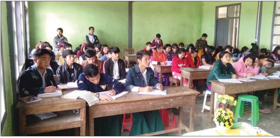
ခေါင်လန်ဖူးမြို့နယ်မှ တက္ကသိုလ်ဝင်စာမေးပွဲဖြေဆိုမည့် ကျောင်းသား ကျောင်းသူများအား ပူတာအို အခြေစိုက်ပညာအထက်တန်းကျောင်း၌ စခန်းသွင်းသင်ကြားပေးစဉ်။