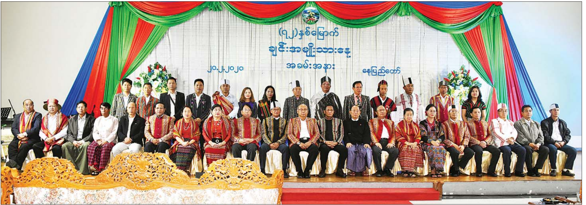
ဒုတိယသမ္မတ ဦးဟင်နရီဗန်ထီးယူ (၇၂)နှစ်မြောက် ချင်းအမျိုးသားနေ့အခမ်းအနားတွင် အမျိုးသားလွှတ်တော်ဥက္ကဋ္ဌ မန်းဝင်းခိုင်သန်း၊ နိုင်ငံတော်ဖွဲ့စည်းပုံအခြေခံဥပဒေဆိုင်ရာ ခုံရုံးဥက္ကဋ္ဌ ဦးမျိုးညွန့်၊ ပြည်ထောင်စုအဆင့် အဖွဲ့အစည်းဝင်များ၊ ချင်းလူမှုရေးအသင်း (နေပြည်တော်)မှ တာဝန်ရှိသူများ၊ ချင်းတိုင်းရင်းသား တိုင်းရင်းသူများနှင့်အတူ စုပေါင်းမှတ်တမ်းတင်ဓာတ်ပုံရိုက်စဉ်။ သတင်းစဉ်