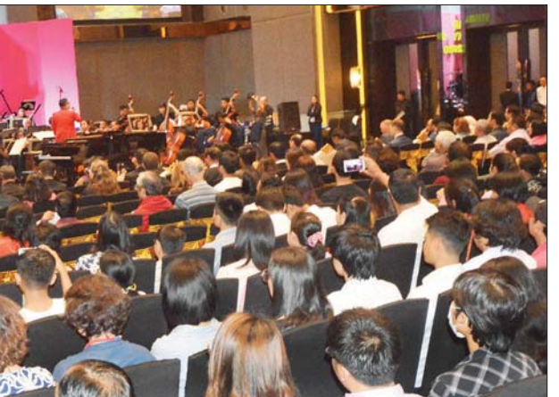
မြန်မာ့အသံနှင့်ရုပ်မြင်သံကြား နိုင်ငံတော်သံစုံတီးဝိုင်းနှင့် ဂျပန်နိုင်ငံမှ အနုပညာရှင်များပူးပေါင်းပြီး "Myanmar National Symphony Orchestra Concerts 2020" တေးဂီတဖျော်ဖြေပွဲ ကျင်းပစဉ်။

သီချင်းနှင့် ဂျပန်နိုင်ငံ နိုင်ငံတော်သီချင်းတို့ဖြင့် အခမ်းအနားကို စတင်ဖွင့်လှစ်သည်။ ထို့နောက် မြန်မာ့အသံနှင့် ရုပ်မြင်သံကြား နိုင်ငံတော်သံစုံတီးဝိုင်းနှင့် ဂျပန်နိုင်ငံမှ တီတောဆီတီးဝိုင်းခေါင်းဆောင် Mr. Yunosuke Yamamoto (Conductor & Composer) ဦးဆောင်သည့် ဂျပန်အနုပညာရှင်များ ပူးပေါင်းကာ အနောက်တိုင်း မြူးစစ်၊ မြန်မာဂန္ထဝင်သီချင်းနှင့် အနောက်တိုင်းသီချင်းများဖြင့် သီဆိုဖျော်ဖြေတင်ဆက်ကြသည်။ ယနေ့ ကျင်းပသည့် တေးဂီတဖျော်ဖြေပွဲကို ဖေဖော်ဝါရီ ၂၅ ရက်တွင် နေပြည်တော် MICC-II ၌ ညနေ ၆ နာရီမှ ည ၈ နာရီအထိ ဖျော်ဖြေတင်ဆက်မည်ဖြစ်ရာ အဆိုပါ ထူးခြားသည့် ဂန္ထဝင်ဂီတဆည်းဆာဖျော်ဖြေပွဲကို မည်သူမဆို အခမဲ့လာရောက် ကြည့်ရှုအားပေးနိုင်ကြောင်း သိရသည်။