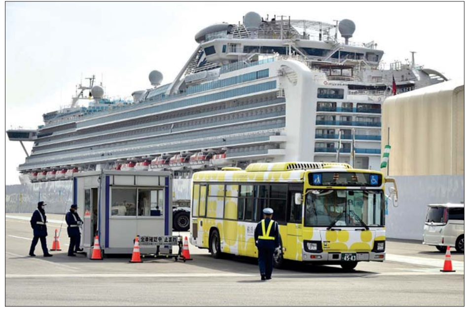
ဗိုင်းရပ်စ်ကူးစက်ခြင်းဖြစ်ပွားခဲ့သည့် Diamond Princess အပျော်စီးသင်္ဘောကို တွေ့ရစဉ်။

တိုကျို ဖေဖော်ဝါရီ ၂၀ ဂျပန်အပျော်စီးသင်္ဘောပေါ်ရှိ ကိုရိုနာဗိုင်းရပ်စ်ကူးစက်ခံရသည့် ခရီး သည်နှစ်ဦး သေဆုံးသွားပြီဖြစ်ကြောင်း သိရသည်။ တိုကျိုမြို့အနီး ယိုကိုဟားမားဆိပ်ကမ်း၌ ကျောက်ချရပ်နားထားသည့် အပျော်စီး သင်္ဘောပေါ်မှ သင်္ဘောအမှုထမ်းများနှင့် ခရီးသည်များအနက် ပထမ ဆုံး လူသေဆုံးမှုရှိလာခြင်းဖြစ်သည်။ ဂျပန်နိုင်ငံသားများဖြစ်ကြသည့် အသက် ၈၇ နှစ် အရွယ် အမျိုးသား နှင့် အသက် ၈၄ နှစ်အရွယ် အမျိုးသမီးတို့ ဖေဖော်ဝါရီ ၂၀ ရက်တွင် သေဆုံးခဲ့ခြင်းဖြစ်ကြောင်း ဂျပန်အစိုးရအာဏာပိုင်များက ဖော်ပြသည်။ ကျန်းမာရေးဝန်ကြီးဌာနအာဏာပိုင်များသည် ရောဂါကူးစက်ပျံ့နှံ့သည့် လမ်းကြောင်းများကို သတိထားစောင့်ကြည့်လျက်ရှိသည်။ သေဆုံးသူနှစ်ဦးစလုံးမှာ ကျန်းမာရေးဆိုင်ရာ အားနည်းသူများ ဖြစ်သည်ဟု သိရသည်။ သေဆုံးသူအမျိုးသားသည် ဖေဖော်ဝါရီ ၁၁ ရက်တွင် သင်္ဘောပေါ်မှ ထွက်ခွာလာခဲ့ပြီး သေဆုံးသူအမျိုးသမီးမှာ ဗိုင်းရပ်စ်ကူးစက်ခံထားရကြောင်း စစ်ဆေးတွေ့ရှိခဲ့ပြီးနောက် ဖေဖော်ဝါ ရီ ၁၂ ရက်တွင် သင်္ဘောပေါ်မှ ထွက်ခွာခဲ့သည်။ သင်္ဘောပေါ်လိုက်ပါလာသူ ခရီးသည်များနှင့် သင်္ဘောအမှုထမ်း ပေါင်း ၃၇၀၀ ရှိပြီး လူ ၆၂၀ ဦးတို့တွင် ဗိုင်းရပ်စ်ကူးစက်ခံရကြောင်း ဖေဖော်ဝါရီ ၁၉ ရက်တွင် အတည်ပြုခဲ့သည်။ ရောဂါကူးစက်ခံရသူ များထဲတွင် အရေးပေါ်အခြေအနေဖြစ်နေသူ ၂၈ ဦးရှိပြီး ၎င်းတို့အနက် နှစ်ဦးသေဆုံးခဲ့ခြင်းဖြစ်သည်။ အေအက်ဖ်ပီ