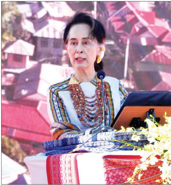
နိုင်ငံတော်၏အတိုင်ပင်ခံပုဂ္ဂိုလ် ဒေါ်အောင်ဆန်းစုကြည် (၇၂) နှစ်မြောက် ချင်းအမျိုးသားနေ့ အခမ်းအနားတွင် မိန့်ခွန်းပြောကြားစဉ်။

(၂၀)ရာစုပင်လုံညီလာခံမှာ ကျွန်မတို့ရဲ့ မိဘတွေ မျှော်မှန်းခဲ့တဲ့ ပြည်ထောင်စုကြီးကို တည်ထောင်ရာမှာ ကံမကောင်း အကြောင်းမလွှစွာနဲ့ပဲ ပြည်တွင်းလက်နက်ကိုင် ပဋိပက္ခကို ရင်ဆိုင်ခဲ့ရပါတယ်။ အကျိုးဆက်အနေနဲ့ ကျွန်မတို့ရဲ့ မိဘ၊ ဘိုးဘွားတွေ မျှော်လင့်ခဲ့တဲ့ ပြည်ထောင်စု တည်ဆောက်ရေးပန်းတိုင်ဟာလည်း ဆုံးခန်းမတိုင်ခဲ့ပါဘူး။ ကျွန်မတို့ မိဘ၊ ဘိုးဘွားတွေ မျှော်လင့်ခဲ့တဲ့ ပြည်ထောင်စုအိမ်ကို ဆက်လက်ဖြည့်ဆည်းနိုင်ဖို့ ဒီကနေ့ (၂၀) ရာစုခေတ်မှာ ကျွန်မတို့ အစိုးရအနေနဲ့ (၂၀) ရာစုပင်လုံညီလာခံကို ခေါ်ယူကျင်းပနေပါတယ်။ မပြီးဆုံးသေးတဲ့