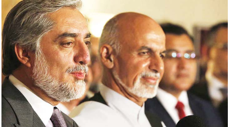
ပြန်လည်ရွေးချယ်ခံရသည့် အာဖဂန်သမ္မတ အက်ရှရက်ဖ်ဂါနီ(ယာဝုံ)နှင့် ယှဉ်ပြိုင်ဘက် အဗ္ဗူလ္လာ အဗ္ဗူလ္လာတို့ကို တွေ့ရစဉ်။