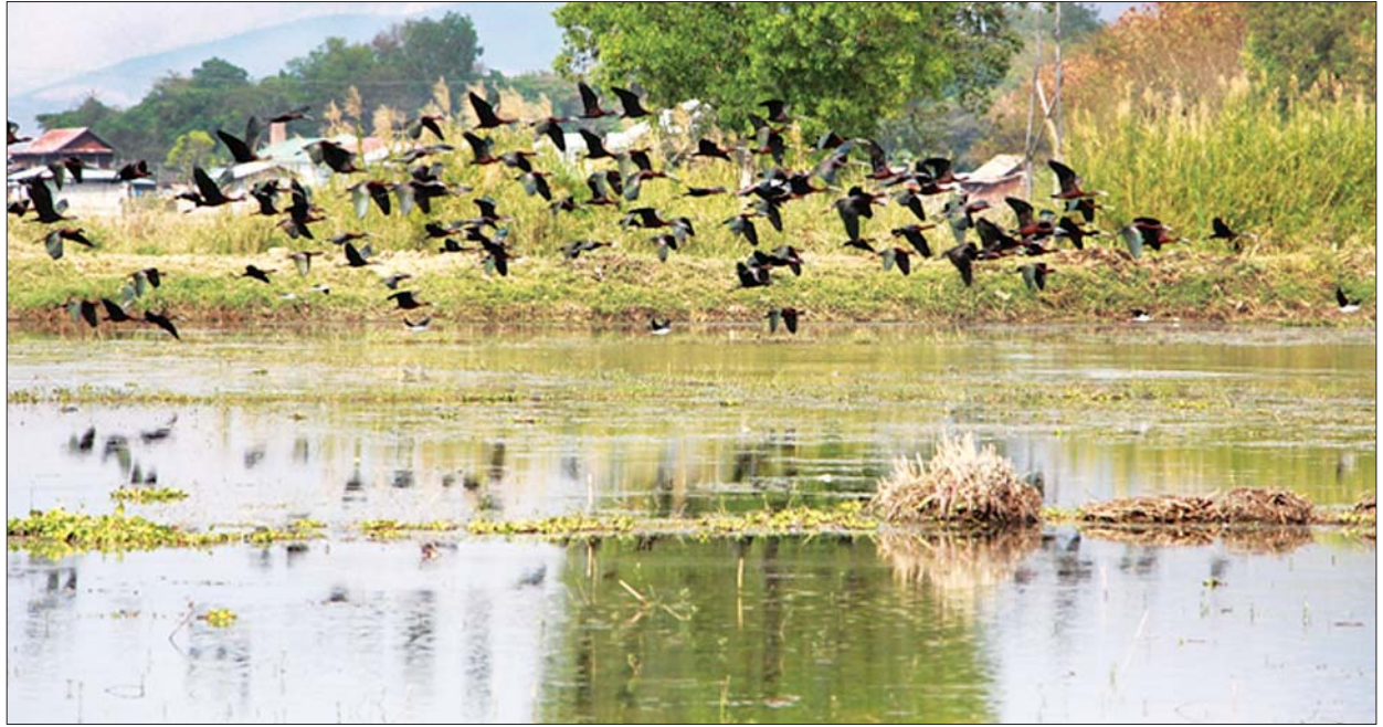
အင်းလေးကန် တောရိုင်းတိရစ္ဆာန်ဘေးမဲ့တောအတွင်း ခရုပုပ်ငှက်များကို တွေ့ရှိရစဉ်။