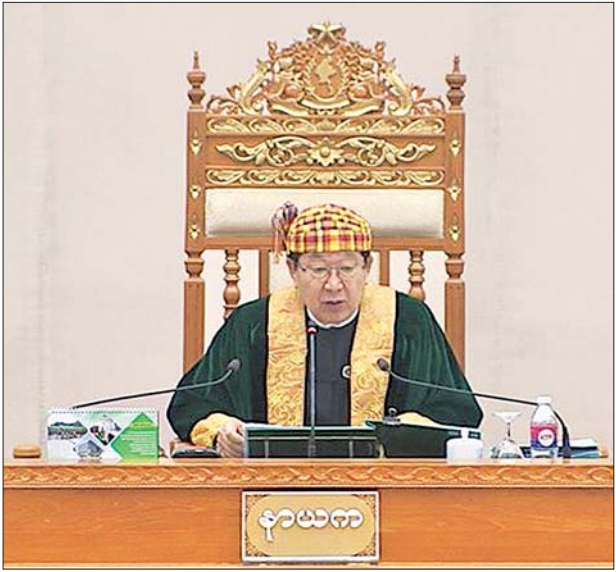
ပြည်ထောင်စုလွှတ်တော်နာယက ဦးတီခွန်မြတ်

အစီရင်ခံစာလအတွင်း အလှူငွေများ လက်ခံသုံးစွဲမှုနှင့် စပ်လျဉ်း၍ အစီရင်ခံစာလအတွင်း ပြည်တွင်း ပြည်ပ စေတနာရှင်များက လှူဒါန်းသည့် ငွေကြေး မိမိတို့အနေဖြင့် လက်ခံရယူခဲ့ခြင်းမရှိပါကြောင်း၊ နည်းပညာရပ်