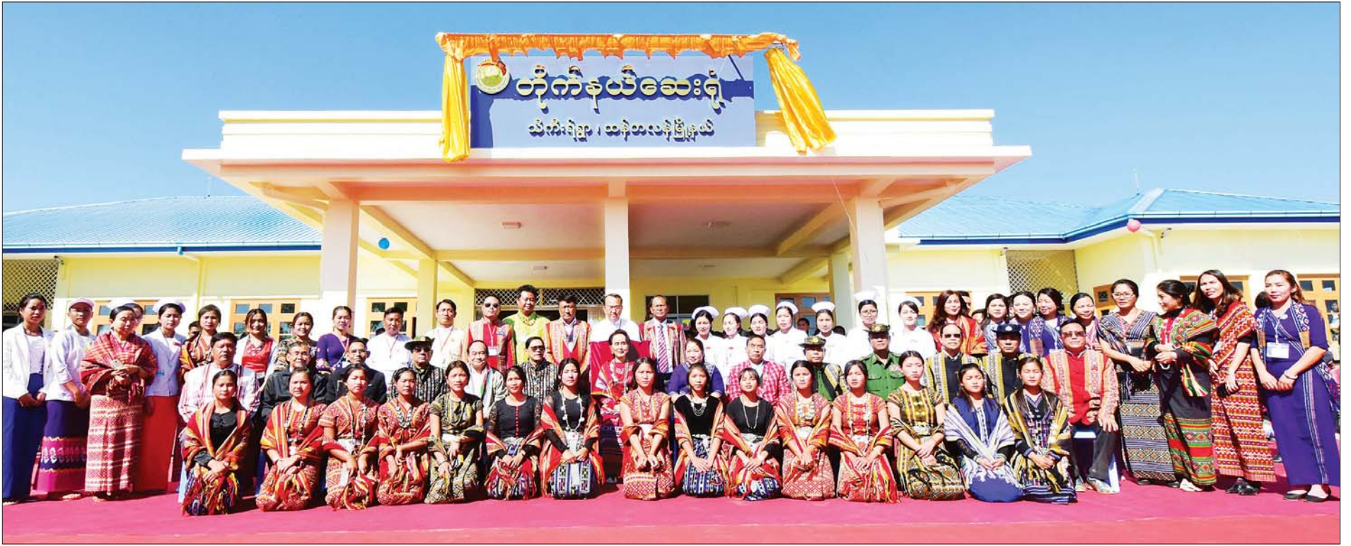
နိုင်ငံတော်၏အတိုင်ပင်ခံပုဂ္ဂိုလ် ဒေါ်အောင်ဆန်းစုကြည်၊ ဒုတိယသမ္မတ ဦးဟင်နရီဗန်ထီးယူ၏ ဇနီး ဒေါက်တာရွှေလွမ်း၊ ပြည်ထောင်စုဝန်ကြီးများ၊ ပြည်နယ်ဝန်ကြီးချုပ် ဦးဆလင်းလျန်လွယ်နှင့် တာဝန်ရှိသူများ သီးကီးရဲကျေးရွာ တိုက်နယ်ဆေးရုံ ဖွင့်ပွဲအခမ်းအနားသို့ တက်ရောက်လာကြသည့် ဒေသခံများနှင့်အတူ စုပေါင်းမှတ်တမ်းတင် ဓာတ်ပုံရိုက်စဉ်။