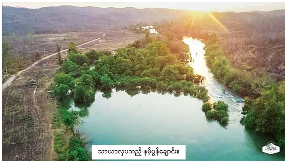
သာယာလှပသည့် နမ့်ပွန်ချောင်း။