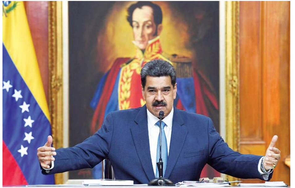
ပင်နီစွဲလားသမ္မတ နီကိုလပ်စ်မာဒူရို