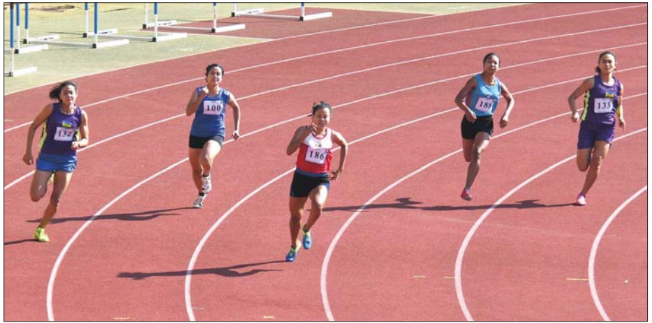
အမျိုးသားတံခွန်စိုက် (ဝန်ကြီးဌာနပေါင်းစုံ) ပြေးခုန်ပစ်ပြိုင်ပွဲ တတိယနေ့တွင် ပါဝင်ယှဉ်ပြိုင်နေကြသူများကို တွေ့ရစဉ်။