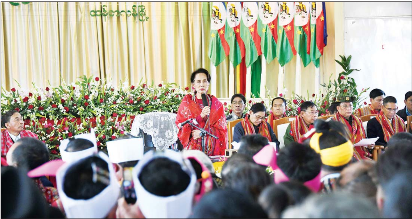
နိုင်ငံတော်၏အတိုင်ပင်ခံပုဂ္ဂိုလ် ဒေါ်အောင်ဆန်းစုကြည် ချင်းပြည်နယ် ထန်တလန်မြို့ရှိ ဒေသခံပြည်သူများအား တွေ့ဆုံအမှာစကား ပြောကြားစဉ်။ သတင်းစဉ်

တွေ့ဆုံပွဲတွင် နိုင်ငံတော်၏အတိုင်ပင်ခံပုဂ္ဂိုလ်က “ပထမဦးဆုံးအနေနဲ့ ကျွန်မတို့ နောက်ကျတဲ့အတွက် တောင်းပန်ပါတယ်။ ရာသီဥတုကြောင့် ကလေးမြို့ကနေ ရဟတ်ယာဉ်ထွက်တာ နောက်ကျပါတယ်။ ဒီလိုခရီးသွား တဲ့အခါ အထူးသဖြင့် ဝေးလံခေါင်သီတဲ့ အရပ်ဒေသတွေ ကိုသွားရင် ရာသီဥတုအခြေအနေကိုကြည့်ပြီး ကျွန်မတို့ လုပ်ရပါတယ်။ ဒါဟာ ကျွန်မတို့အားလုံး သင်ခန်းစာယူစရာ တစ်ခုပါ။ သဘာဝက ဖြစ်ပေါ်တဲ့စွဲတွေကို ကျွန်မတို့က ပြောင်းလဲမရပါဘူး။ ပြောင်းလဲမရတဲ့အခါကျတော့ ဒါတွေ ကို ကျွန်မတို့ ကျော်လွှားဖို့လိုပါတယ်။ ဒါကြောင့် ချင်းပြည် နယ်လို နယ်စပ်ဒေသ အင်မတန်ဝေးလံခေါင်သီတဲ့နေရာ မှာ ဘဝက ကြမ်းကြမ်းတမ်းတမ်းနဲ့ ရင်ဆိုင်ရတဲ့ နေရာ တွေကို အထူးဖွံ့ဖြိုးတိုးတက်ဖို့ လုပ်ပေးနေပါတယ်။ ဒီလို လုပ်မှလည်း ကျွန်မတို့နိုင်ငံဟာ ပိုပြီး တစ်ယောက်နဲ့