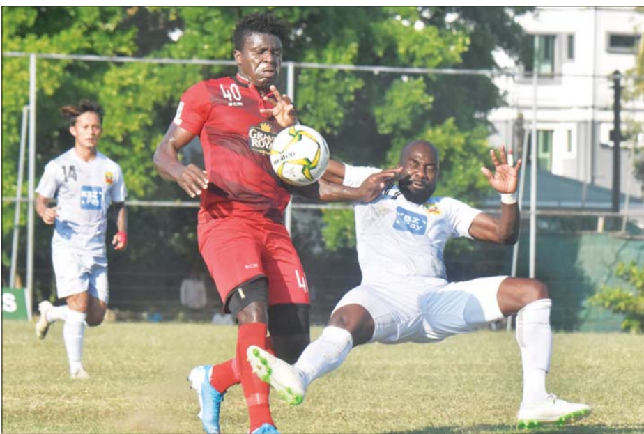
၂၀၂၀ ချာရတီဖလားပြိုင်ပွဲတွင် ရန်ကုန်နှင့် ရှမ်းယူနိုက်တက်အသင်း တွေ့ဆုံခဲ့စဉ်။