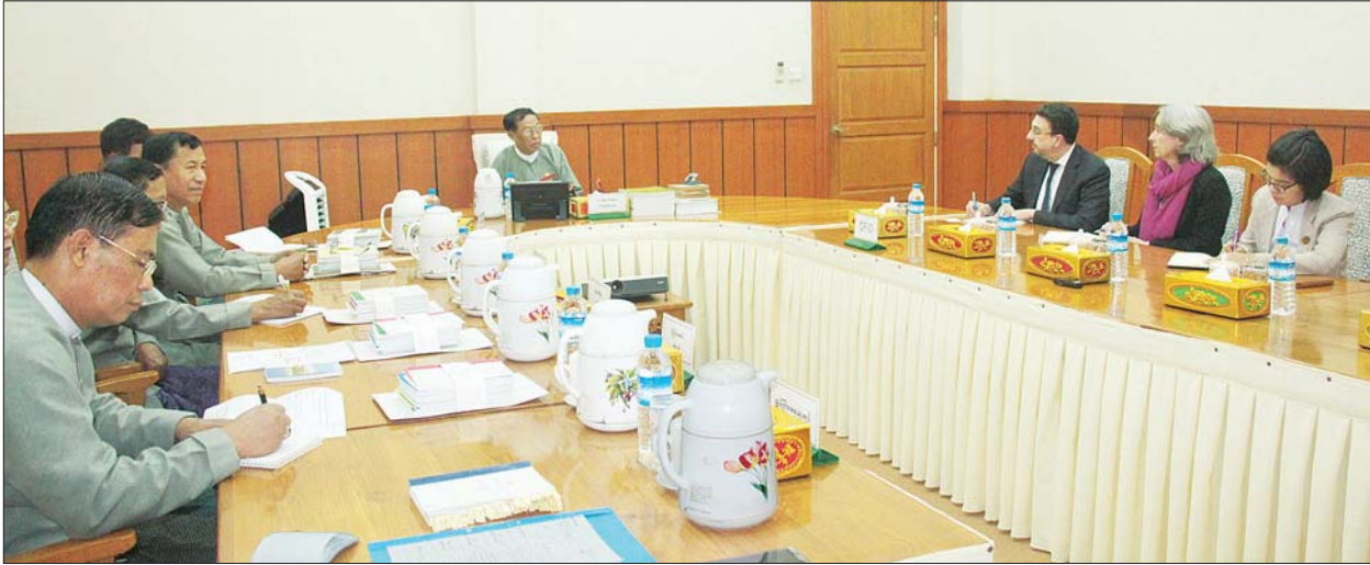
ပြည်ထောင်စုရွေးကောက်ပွဲကော်မရှင်ဥက္ကဋ္ဌ ဦးလှသိန်း Department for International Development - DFID (UKaid) ၏ External Team of Election Experts ခေါင်းဆောင်ဖြစ်သူ Mr. Holly Ruthrauff နှင့် အဖွဲ့အား လက်ခံတွေ့ဆုံစဉ်။ သတင်းစဉ်

နေပြည်တော် ဖေဖော်ဝါရီ ၁၉ ပြည်ထောင်စုရွေးကောက်ပွဲကော်မရှင်ဥက္ကဋ္ဌ ဦးလှသိန်းသည် Department for International Development - DFID (UKaid) ၏ External Team of Election Experts ခေါင်းဆောင်ဖြစ်သူ Mr. Holly Ruthrauff နှင့် အဖွဲ့အား ယနေ့ နံနက် ၁၀ နာရီတွင် နေပြည်တော်ရှိ ပြည်ထောင်စုရွေးကောက်ပွဲကော်မရှင်ဥက္ကဋ္ဌရုံး အစည်းအဝေးခန်းမ၌ လက်ခံတွေ့ဆုံသည်။ ထိုသို့တွေ့ဆုံစဉ် ၂၀၂၀ ပြည့်နှစ် အထွေထွေရွေးကောက်ပွဲကို ချမှတ်ထားသော စံ(၅)ချက်နှင့်အညီ အောင်မြင်စွာကျင်းပနိုင်ရေး ဆောင်ရွက်လျက်ရှိသည့် အခြေအနေ၊ တိုင်းဒေသကြီး/ပြည်နယ်များတွင် ရွေးကောက်ပွဲဆိုင်ရာ စွမ်းရည်မြှင့်တင်ရေးနှင့် ဆင့်ပွားသင်တန်းများ ဆောင်ရွက်နေမှု၊ ပထမအကြိမ် မဲပေးမည့်လူငယ်များအတွက် မဲဆန္ဒရှင်အသိပညာပေးလုပ်ငန်းများ ဆောင်ရွက်နေမှု၊ အမှန်းစကားများ၊ သတင်းအမှားများ တားဆီးကာကွယ်ရေးနှင့် သတင်းမှန်ထုတ်ပြန်နိုင်ရေးဆောင်ရွက်နေမှု၊ နယ်စပ်ဒေသ တိုက်ပွဲရှောင်စခန်းများရှိ မဲဆန္ဒရှင်များ မဲပေးပိုင်ခွင့်ရရှိရေးဆောင်ရွက်နေမှု၊ ပြည်တွင်းနှင့် နိုင်ငံတကာရွေးကောက်ပွဲ စောင့်ကြည့်လေ့လာရေးအဖွဲ့များ ဖိတ်ကြားသွားမည့်အစီအစဉ်များနှင့်စပ်လျဉ်း၍ ရင်းနှီးပွင့်လင်းစွာ ဆွေးနွေးခဲ့ကြသည်။ သတင်းစဉ်