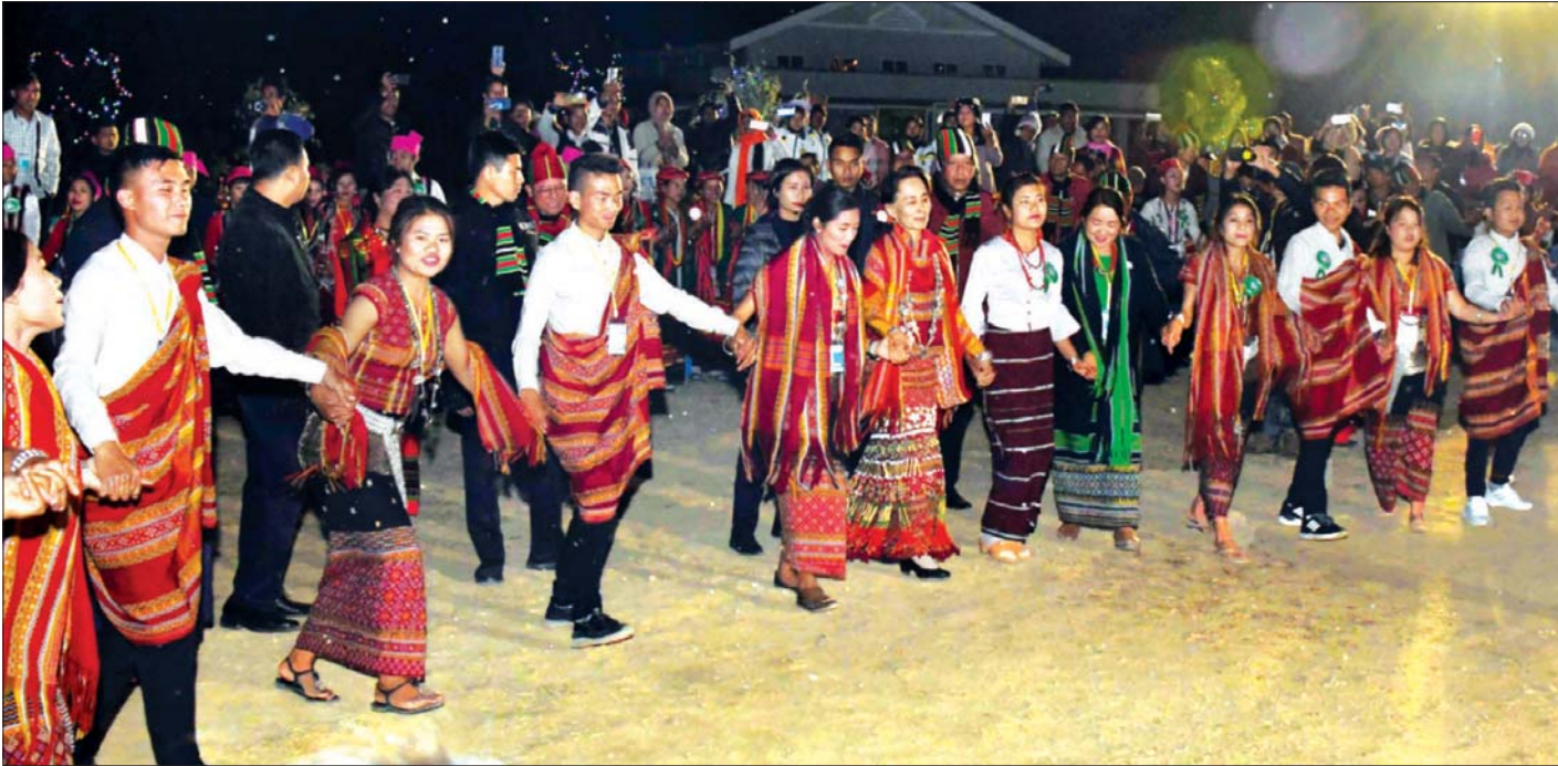
နိုင်ငံတော်၏အတိုင်ပင်ခံပုဂ္ဂိုလ် ဒေါ်အောင်ဆန်းစုကြည် (၇၂)နှစ်မြောက် ချင်းအမျိုးသားနေ့ အကြိုညှိမီးပွဲနှင့် ရိုးရာယဉ်ကျေးမှုအက ဖျော်ဖြေပွဲတွင် တိုင်းရင်းသား တိုင်းရင်းသူ များနှင့်အတူ ပါဝင်ဆင်နွှဲစဉ်။