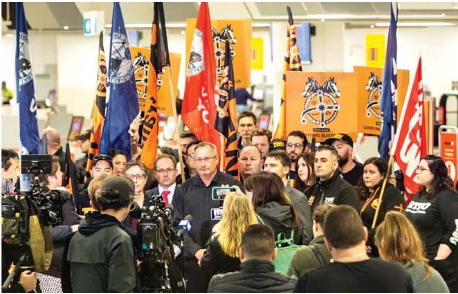
ဂျက်စတား လေကြောင်းလိုင်းမှ ဝန်ထမ်းများ မဲလ်ဘုန်းလေဆိပ်၌ ဆန္ဒထုတ်ဖော်နေစဉ်။

လေကြောင်းလိုင်း ဝန်ထမ်းများ က လေဆိပ်စင်္ကြံများတွင် စုဝေးကာ လုပ်ခ လစာတိုးမြှင့်ပေးရန်၊ ဝန်ထမ်း များဘေးကင်းလုံခြုံရေးနှင့် အလုပ်ချိန် အဆင်ပြေအောင် ဆောင်ရွက်ပေးရန် အော်ဟစ်တောင်းဆိုခြင်း၊ ဆိုင်းဘုတ်