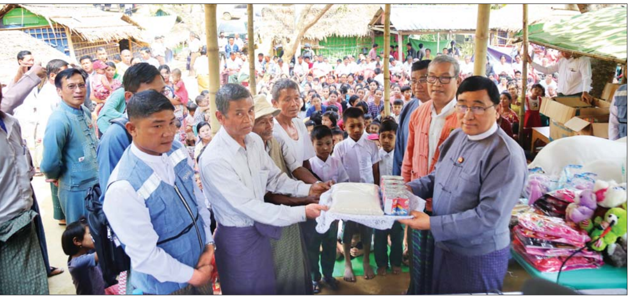
ပြည်ထောင်စုဝန်ကြီး ဒေါက်တာဝင်းမြတ်အေးနှင့် ရခိုင်ပြည်နယ် ဝန်ကြီးချုပ် ဦးညီပုတို့က တိုက်ပွဲရောင်တိုင်းရင်းသားပြည်သူများအတွက် ထောက်ပံ့ပစ္စည်းများ ပေးအပ်စဉ်။

မွန်းလုံပိုင်းတွင် ပြည်ထောင်စုဝန်ကြီးနှင့် အဖွဲ့သည် ဘူးသီးတောင်မြို့ တောင်ရပ်ကွက် ရန်အောင်မြေဘုန်းကြီးကျောင်းရှိ တိုက်ပွဲရောင်စခန်း၊ လမ်းမဘုန်းတော်ကြီးကျောင်းရှိ တိုက်ပွဲရောင်စခန်းနှင့် မြတောင်ဘုန်းတော်ကြီးကျောင်းရှိ တိုက်ပွဲရောင်စခန်းများရှိ ပြည်သူများနှင့် တွေ့ဆုံအားပေးစကား ပြောကြားပြီး