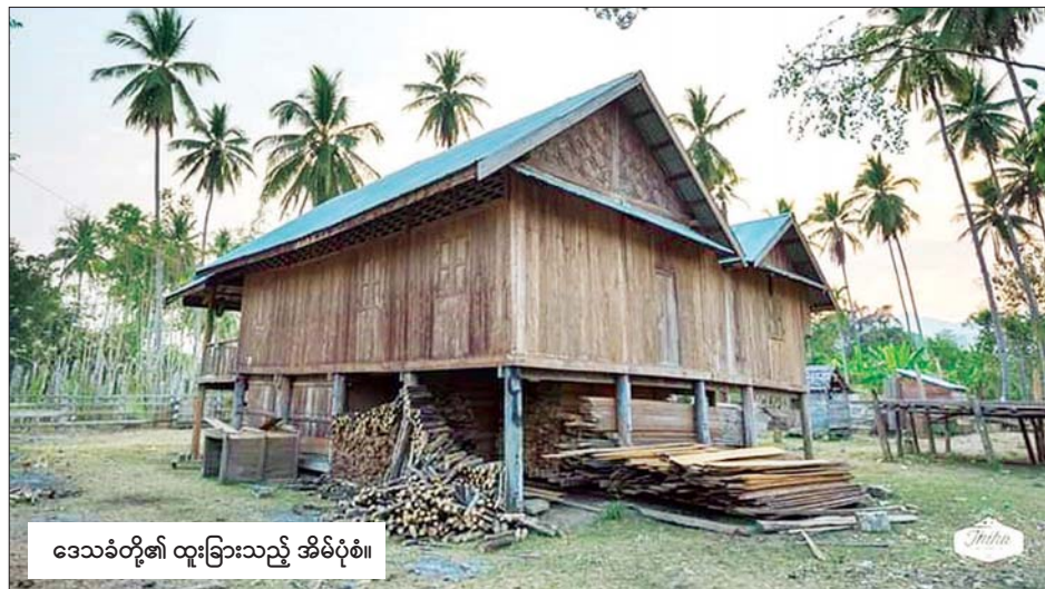
ဒေသခံတို့၏ ထူးခြားသည့် အိမ်ပုံစံ။