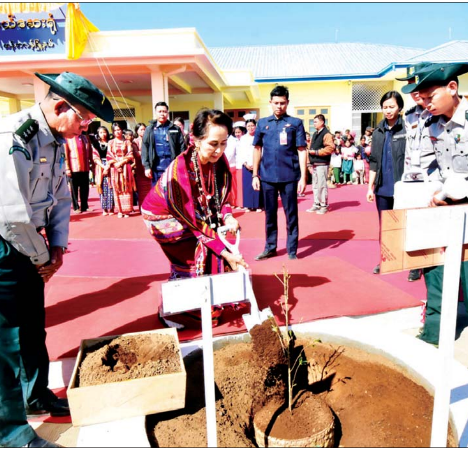
နိုင်ငံတော်၏အတိုင်ပင်ခံပုဂ္ဂိုလ် ဒေါ်အောင်ဆန်းစုကြည် သီးကီးရဲကျေးရွာ တိုက်နယ်ဆေးရုံ မျက်နှာစာ၌ ဂျပန် ချယ်ရီပင်ကို အမှတ်တရစိုက်ပျိုးပေးစဉ်။

ချင်းပြည်နယ်ဆိုရင် မိုးတွင်းကာလမှာ သွားရေး လာရေး အင်မတန်မှ ခက်ပါတယ်။ ဧရာဝတီတိုင်းဒေသ ကြီးလိုနေရာမှာလည်း သွားရေးလာရေး အင်မတန်မှ ခက်ပါတယ်။ ဒီလိုနေရာတွေကို ကျွန်မတို့ကနေပြီး ဖြေရှင်း ပေးဖို့ ကြိုးစားရပါတယ်။ ဒီလမ်းပန်းဆက်သွယ်ရေး ခက်ခဲ ခြင်းရဲ့ အကျိုးဆက်တွေက ကျန်းမာရေးအရ ပညာရေး အရ စီးပွားရေးအရ ခက်ခဲလာပါတယ်။ ကျန်းမာရေးအရ ဆိုရင် ရွာတိုင်းရွာတိုင်းမှာ ဆေးခန်းတွေ ဖွင့်ပေးဖို့ ဆိုတာ ကျွန်မတို့ အခုအချိန်မှာ တတ်နိုင်တဲ့ကိစ္စ မဟုတ် ပါဘူး။ ရွာတိုင်းရွာတိုင်းမှာ ဆေးခန်းမရှိဘူးဆိုရင် လမ်းပန်း ဆက်သွယ်ရေး မကောင်းဘူးဆိုရင် ဆေးခန်းတစ်ခုရှိတဲ့ နေရာကို ရောက်ဖို့ အင်မတန်မှခက်ခဲပါတယ်။ ခက်ခဲတဲ့အခါ အရေးပေါ်ကုသဖို့လိုရင် မလုပ်နိုင်ပါဘူး။ ဒီအတိုင်းပါပဲ။ ချင်းပြည်နယ်နဲ့ ဧရာဝတီတိုင်းဒေသကြီးမှာလည်း ဒီလို ဖြစ်နေပါတယ်။