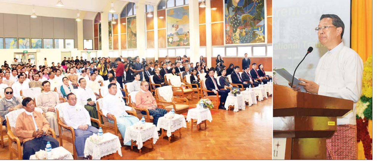
ပြည်ထောင်စုဝန်ကြီး ဒေါက်တာမျိုးသိမ်းကြီး မြန်မာနိုင်ငံအစိုးရနှင့် စင်ကာပူနိုင်ငံအစိုးရတို့ ပူးပေါင်းဖွင့်လှစ်သော စင်ကာပူ-မြန်မာ သက်မွေးပညာသင်တန်းကျောင်း (SMVTI) လွှဲပြောင်းပေးအပ်ပွဲတွင် အမှာစကားပြောကြားစဉ်။

ရန်ကုန် ဖေဖော်ဝါရီ ၁၉ မြန်မာနိုင်ငံအစိုးရနှင့် စင်ကာပူနိုင်ငံအစိုးရတို့ ပူးပေါင်းဖွင့်လှစ်သော စင်ကာပူ-မြန်မာ သက်မွေးပညာသင်တန်းကျောင်း (SMVTI) လွှဲပြောင်းပေးအပ်ပွဲအခမ်းအနားကို ယနေ့ မွန်းလွဲပိုင်းက ရန်ကုန်မြို့ ဗဟန်းမြို့နယ် နတ်မောက်လမ်းသွယ်ရှိ အဆိုပါကျောင်းဝင်း၌ ကျင်းပသည်။