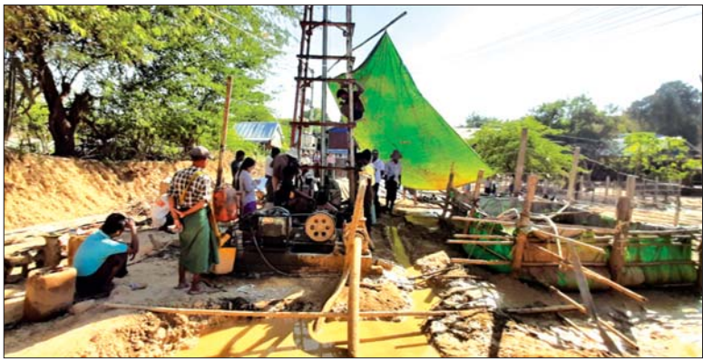
ကျေးရွာတစ်ရွာ၌ စက်ရေတွင်း တူးဖော်ပေးနေစဉ်။

စလင်း ဖေဖော်ဝါရီ ၁၉ မကွေးတိုင်းဒေသကြီး စလင်းမြို့နယ်အတွင်းရှိ ကျေးရွာ ခုနစ်ရွာ၌ နွေရာသီကာလသောက်သုံးရေ ဖူလုံစွာရရှိရေး အတွက် စက်ရေတွင်းနှင့် ဆက်စပ်လုပ်ငန်းများကို စိုက်ပျိုးရေး၊ မွေးမြူရေးနှင့် ဆည်မြောင်းဝန်ကြီးဌာန ကျေးလက်ဒေသဖွံ့ဖြိုးတိုးတက်ရေးဦးစီးဌာနက ဆောင်ရွက်ပေးလျက်ရှိကြောင်း သိရသည်။