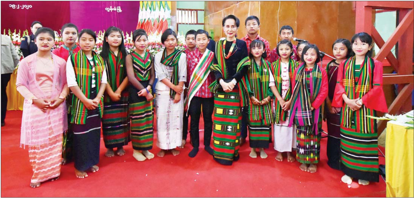
နိုင်ငံတော်၏အတိုင်ပင်ခံပုဂ္ဂိုလ် ဒေါ်အောင်ဆန်းစုကြည် ချင်းပြည်နယ် တွန်းဇံမြို့ရှိ ဒေသခံတိုင်းရင်းသားများနှင့် စုပေါင်းမှတ်တမ်းတင်ဓာတ်ပုံရိုက်စဉ်။ သတင်းစဉ်

တစ်ယောက် ပိုပြီးဆက်သွယ်မှုရှိလာမှာပါ။ ချင်းပြည်နယ်မှာဆိုရင် တောင်တန်းတွေ၊ အတက် အဆင်းတွေက အလွန်များပါတယ်။ လမ်းပန်းဆက်သွယ် ရေးက နည်းပါးပါတယ်။ ဒါကြောင့် ချင်းပြည်နယ်ရဲ့ လမ်းပန်းဆက်သွယ်ရေးကို အထူးအလေးထားပြီး လုပ်နေ ပါတယ်။ ဒါပေမယ့် ကျွန်မတို့နိုင်ငံက ကျယ်ပြန့်တဲ့အတွက် တစ်နိုင်ငံလုံးကို မျှမျှတတဖြစ်အောင် လုပ်ရပါတယ်။ အဲဒါ ကို ကျွန်မတို့ တိုင်းရင်းသားတွေအားလုံးက နားလည်မှု ပေးစေချင်ပါတယ်။ ကျွန်မတို့အနေနဲ့ ပြည်နယ်နဲ့ တိုင်းဒေသကြီးတွေကို တိုးတက်ဖွံ့ဖြိုးစေချင်ပါတယ်။ ချင်းပြည်နယ်မှာဆိုရင် ချင်းတိုင်းရင်းသားတွေက လိုအပ်ချက်တွေကို ပိုပြီးသိကြ