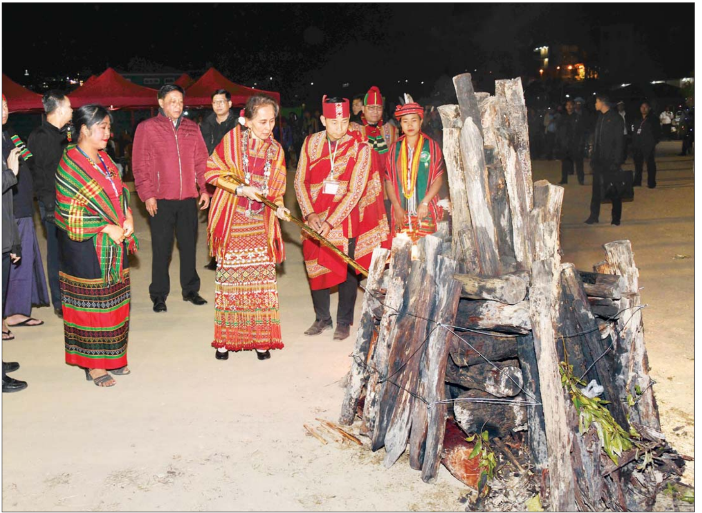
နိုင်ငံတော်၏အတိုင်ပင်ခံပုဂ္ဂိုလ် ဒေါ်အောင်ဆန်းစုကြည် (၇၂)နှစ်မြောက် ချင်းအမျိုးသားနေ့အကြိုည ပီပုံပွဲကို မီးရှူးတိုင်ဖြင့် ထွန်းညှိဖွင့်လှစ်ပေးစဉ်။ သတင်းစဉ်

ကျွန်မ နိုင်ငံရေးလောကထဲကို ဝင်လာတာ ဘာလိုလို့နဲ့ နှစ် ၃၀ ကျော်သွားပြီ။ ဒီနှစ် ၃၀ ကျော်အတွင်းမှာ ကျွန်မပြည်နယ်နဲ့ တိုင်းဒေသကြီးတွေကို ရောက်ပါတယ်။ တစ်တိုင်းပြည်လုံးနဲ့အောင် ရောက်ခဲ့ပါတယ်။ အခုလို အစိုးရ တာဝန်ထမ်းဆောင်နေတဲ့ ပုဂ္ဂိုလ်တစ်ယောက် အနေနဲ့ ခရီးသွားရ လာရတာက အရင်တုန်းက ပါတီခေါင်းဆောင်တစ်ယောက်အနေနဲ့ ခရီးသွားရတာလောက် ကျေနပ်စရာ မကောင်းပါဘူး။ ဘာဖြစ်လို့လဲဆိုတော့ အရင်တုန်းက ကျွန်မတို့ကားနဲ့သွားတဲ့အတွက် လမ်းမှာ ရပ်လိုရတယ်။ ရွာတွေမှာ ရပ်လိုရတယ်။ လမ်းကပြည်သူတွေနဲ့ ကားရပ်ပြီး စကားပြောလိုရပါတယ်။ ချင်းပြည်နယ်ကို ၂၀၀၁ ခုနှစ်က လာတုန်းကဆိုရင် လမ်းမှာ လမ်းအလုပ်သမားတွေ၊ လမ်းဆောက်နေတဲ့ အလုပ်သမားတွေနဲ့ စကားရပ်ပြောလိုရတယ်။ အဲဒီလို ထိတွေ့မှုရနိုင်တဲ့ အခါကျတော့ တစ်နည်းအားဖြင့် ကျွန်မအတွက် ကျေနပ်စရာလို မြင်ပါတယ်။ ပြည်သူတွေနဲ့ ပိုပြီးနီးနီးကပ်ကပ်